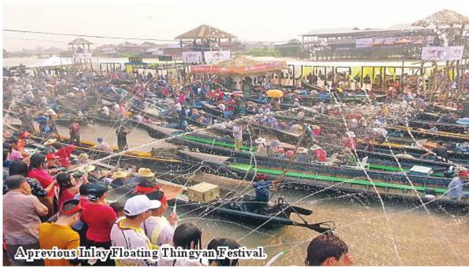
A previous Inlay Floating Thingyan Festival.