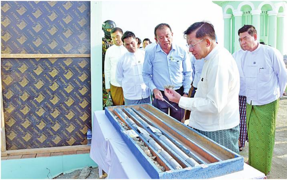
နိုင်ငံတော်စီမံအုပ်ချုပ်ရေးကောင်စီဥက္ကဋ္ဌ နိုင်ငံတော်ဝန်ကြီးချုပ် ဗိုလ်ချုပ်မှူးကြီးမင်းအောင်လှိုင် ကန်တော်ကြီးအတွင်း မြေသားစမ်းသပ်မှုလုပ်ငန်းများမှ ထွက်ရှိလာသည့် အပေါ့ယံမြေလွှာနှင့် ကျောက်စကျောက်နုများ၊ သဲကျောက်လွှာများကို ကြည့်ရှုစစ်ဆေးစဉ်။