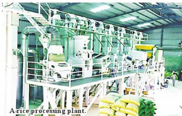
A rice processing plant.