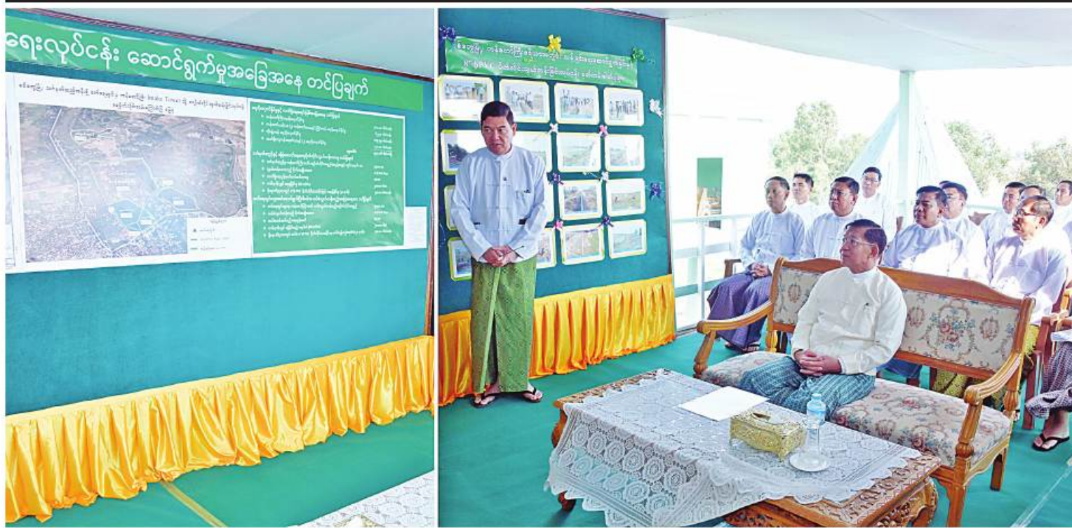
နိုင်ငံတော်စီမံအုပ်ချုပ်ရေးကောင်စီဥက္ကဋ္ဌ နိုင်ငံတော်ဝန်ကြီးချုပ် ဗိုလ်ချုပ်မှူးကြီးမင်းအောင်လှိုင်အား ရခိုင်ပြည်နယ်ဝန်ကြီးချုပ် ဦးထိန်လင်းက ကန်တော်ကြီးအတွင်းသို့ မြေအောက်ရေမှ ရေပြန်လည်ဖြည့်တင်းပေးနိုင်ရေး ဆောင်ရွက်လျက်ရှိမှုအခြေအနေများနှင့် စစ်တွေမြို့၏ ရေလိုအပ်ချက်အခြေအနေများကို ရှင်းလင်းတင်ပြစဉ်။

ကောင်စီဥက္ကဋ္ဌ နိုင်ငံတော်ဝန်ကြီးချုပ်သည် သင်္ကန်းတည်ဆောက်မှုနှင့် ကန်တော်ကြီးသို့ မြေအောက်ရေအကူပိုက်လိုင်းမှ ရေသွယ်တန်းမှုကို စက်ခလုတ်နှိပ်၍ စတင်ဖွင့်လှစ်ပေးပြီး ရေရရှိမှုအခြေအနေကို ကြည့်ရှုအားပေးသည်။