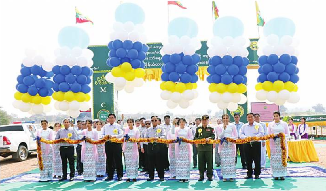
သမဝါယမနှင့်ကျေးလက်ဖွံ့ဖြိုးရေးဝန်ကြီးဌာန ပြည်ထောင်စုဝန်ကြီး ဦးလှမိုး၊ မကွေးတိုင်းဒေသကြီးဝန်ကြီးချုပ် ဦးတင့်လွင်နှင့် တာဝန်ရှိသူများက မန်းချောင်းရေနိမ့်တံတားကို ဖဲကြိုးဖြတ်ဖွင့်လှစ်ပေးစဉ်။

နေပြည်တော် မတ် ၃၀ (၇၈)နှစ်မြောက် တစ်မတော်နေ့ကို ဂုဏ်ပြုသောအားဖြင့် မကွေးတိုင်းဒေသကြီး မင်းဘူးခရိုင် မင်းဘူး(စက)မြို့နယ် အိုးပြင်မဲ-အိုင်းမကွေးရွာချင်း ဆက်သွယ်သော လမ်းပေါ်ရှိ မန်းချောင်းရေနိမ့်တံတားဖွင့်ပွဲအခမ်းအနားကို ယနေ့နံနက်ပိုင်းက ကျင်းပသည်။ အခမ်းအနားသို့ သမဝါယမနှင့်ကျေးလက်