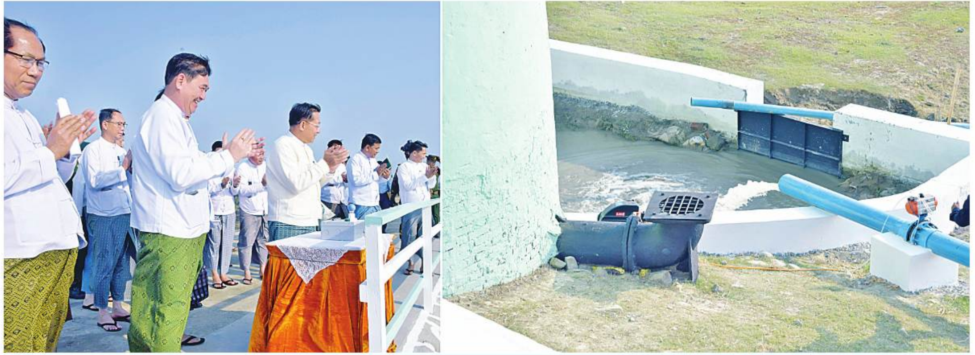
နိုင်ငံတော်စီမံအုပ်ချုပ်ရေးကောင်စီဥက္ကဋ္ဌ နိုင်ငံတော်ဝန်ကြီးချုပ် ဗိုလ်ချုပ်မှူးကြီးမင်းအောင်လှိုင် သင်္ဂနက်ဆည်နှင့်ကန်တော်ကြီးသို့ မြေအောက်ရေအကူပိုက်လှိုင်းမှ ရေသွယ်တန်းမှုကို စက်ခလုတ်နှိပ်၍ စတင်ဖွင့်လှစ်ပေးပြီး ရေရရှိမှုအခြေအနေကို ကြည့်ရှုအားပေးစဉ်။

အကြမ်းဖက်မှုပျောက်ရေးအတွက် ပြည်သူ့ အသိပေးနှိုးဆော်ချက် ၁။ ပြည်သူ့အတွက်ဟု သုံးနှုန်း၍ ရဟန်းသံဃာများ၊ ဆရာ၊ ဆရာမများ အပါအဝင် နိုင်ငံ့ဝန်ထမ်းများနှင့် ပြည်သူကို သတ်ဖြတ်၊ လုယက်ခြင်းကို CRPH၊ NUG၊ PDF အမည်ခံအကြမ်းဖက်အုပ်စုများက ဥပဒေမဲ့ကျူးလွန်နေသည်။ ၂။ ခြိမ်းခြောက်၊ လူသတ်၊ အပျက်အမှောင့်လုပ်ရပ်များလုပ်ဆောင်နေသည့် CRPH၊ NUG၊ PDF အကြမ်းဖက်သမားများကို အားပေးမှု၊ ထောက်ခံမှု၊ ကူညီထောက်ပံ့မှုမပြုခြင်းသည် ပြည်သူ့လူထု၏ အသက်အိုးအိမ်စည်းစိမ်ကို ကာကွယ်ပေးခြင်းဖြစ်သည်။ ၃။ ယင်းတို့၏ လက်နက်၊ ခဲယမ်းကိုင်တွယ်သယ်ဆောင်မှုနှင့် အကြမ်းဖက်သမားတို့၏သတင်းကို လျှို့ဝှက်ပေးပို့ခြင်းသည် အပြစ်မဲ့ပြည်သူများ၏ အသက်အိုးအိမ်စည်းစိမ်ကို ကာကွယ်ပေးခြင်းဖြစ်သည်။