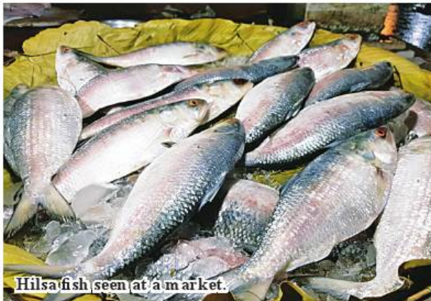
Hilsa fish seen at a market.

Plans are underway to search the Myanmar's freshwater resources for Hilsa by conducting the research works as well as conserving the species of Hilsa. ASH