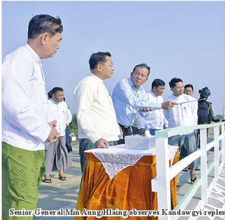
Senior General Min Aung Hlaing observes Kandawgyi replenishing project.