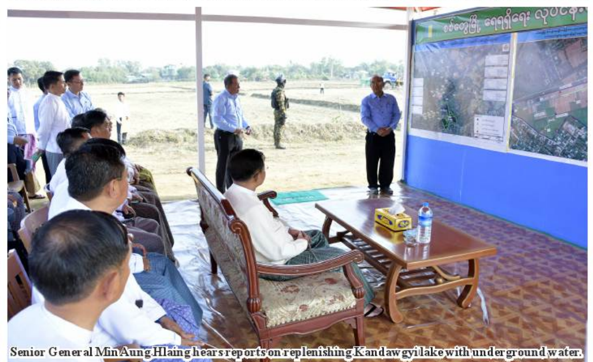
Senior General Min Aung Hlaing hears reports on replenishing Kandawgyi lake with underground water.

Agriculture, Livestock and Irrigation in Sittway, and heard reports on locations of chosen for drilling tube wells based on geophysical tests in the 40-care quality strain planta-