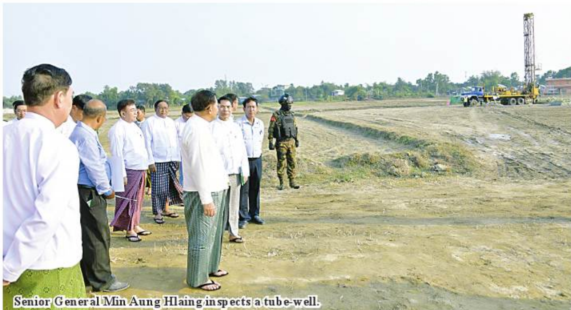
Senior General Min Aung Hlaing inspects a tube well.

from Thinganet Dam to Kandawgyi lake to replenish the latter with water from the dam and No. 1 tube well and underground water was supplied to Kandawgyi lake starting from today. Measures are being taken to replenish Kandawgyi lake with underground water from other tube wells to be drilled, to lay pipelines and to install water booster pumps. Kandawgyi lake can store 481.10 million gallons of water while Kandawngye lake 1 and 2, Kandawlay lake and Triangle lake can store 62.27 million gallons of water. Toeche lake can store 119.59 million gallons of water while Setyokya lake 1 and 2 can store 120 million gallons of water. Replenishing Kandawgyi lake with underground water can contribute a lot to supplying sufficient water to Sittway.