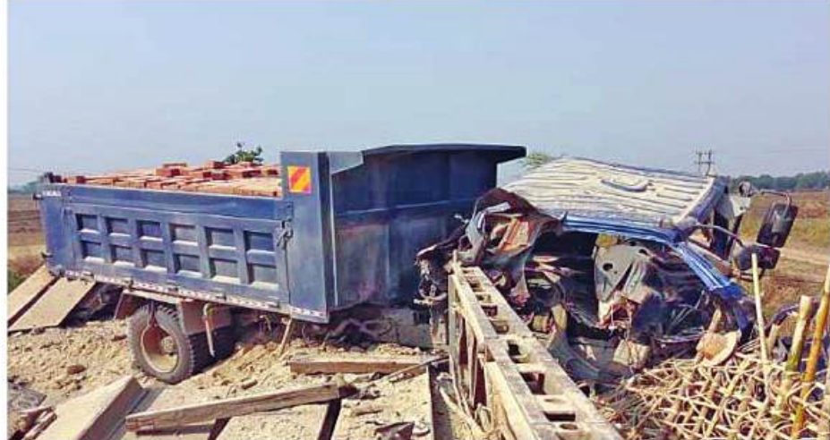
ကျောက်ကြီးမြို့နယ်အတွင်း KNLA အဖွဲ့မှ အကြမ်းဖက်မှုကို လိုလားသောအဖွဲ့က ထောင်ထားသည့် ဒေသန္တရကားမိုင်းအား နင်းမိပေါက်ကွဲပြီး ပျက်စီးခဲ့သည့် မော်တော်ယာဉ်၏ မှတ်တမ်းဓာတ်ပုံ။