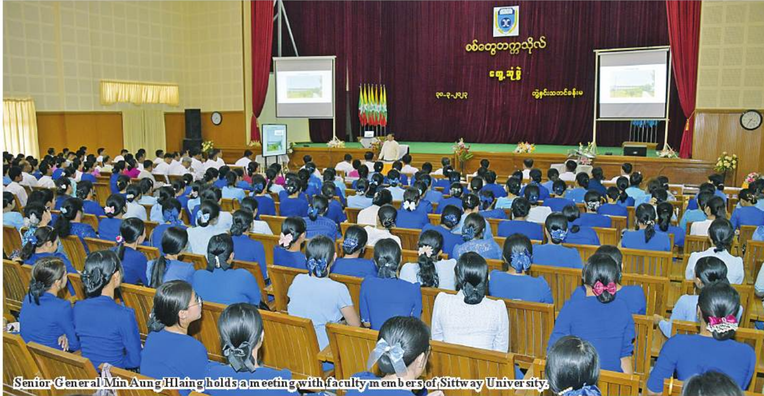
Senior General Min Aung Hlaing holds a meeting with faculty members of Sittway University.