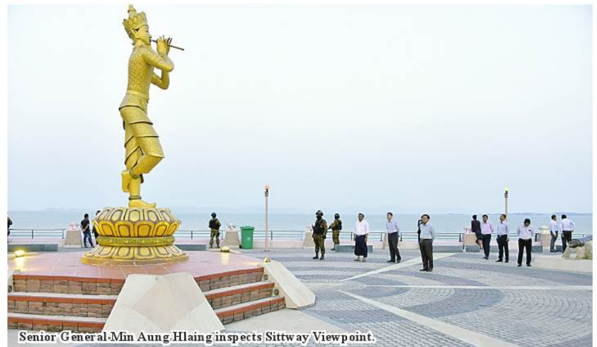
Senior General Min Aung Hlaing inspects Sittway Viewpoint.

Later, the Senior General and wife and party went to Sittway View Point where they viewed the local people taking their rest and recreation. The Senior General then instructed officials to make the View Point clean and pleasant. 100