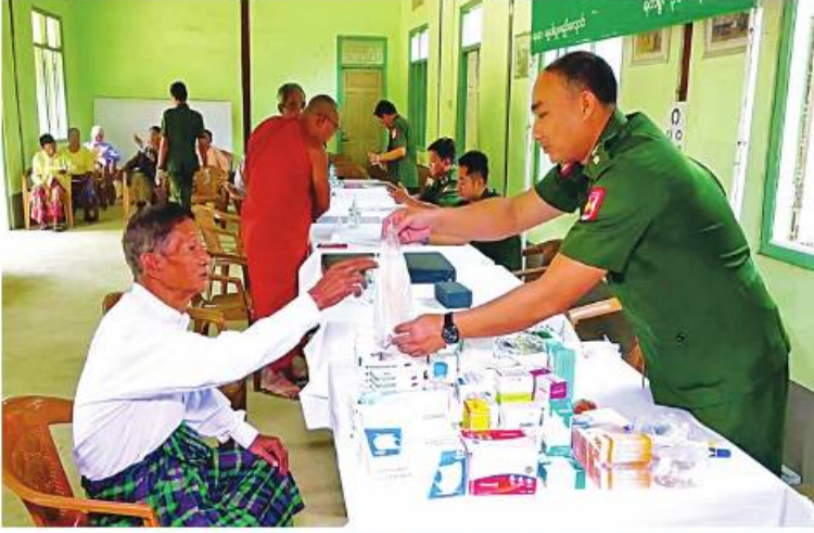
မြောက်ပိုင်းတိုင်းစစ်ဌာနချုပ် နယ်မြေခံဆေးကုသရေးအဖွဲ့က သံဃာတော်များနှင့် ဒေသခံပြည်သူများကို ကျန်းမာရေးစောင့်ရှောက်မှုလုပ်ငန်းများ ဆောင်ရွက်ပေးခဲ့ခြင်း

တိုင်းစစ်ဌာနချုပ် နယ်မြေခံဆေးကုသရေး အဖွဲ့က သံဃာတော်အပါး ၅၀ နှင့် ဒေသခံ ပြည်သူဦးရေ ၅၀၀ ကို ခွဲစိတ်ကုသမှုဆိုင်ရာ ရောဂါ၊ အရိုးအကြောရောဂါ၊ အထွေထွေ ရောဂါတို့နှင့်ပတ်သက်၍ လိုအပ်သည့်ဆေးဝါး ကုသမှုများဆောင်ရွက်ပေးကြရာ တိုင်းစစ် ဌာနချုပ်မှ တာဝန်ရှိသူများက သွားရောက် ကြည့်ရှု၍ လိုအပ်သည်များ ညှိနှိုင်းဆောင် ရွက်ပေးခဲ့ကြောင်း သတင်းရရှိသည်။