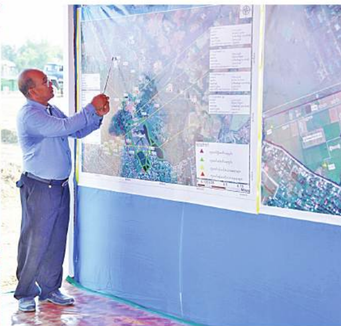
နိုင်ငံတော်စီမံအုပ်ချုပ်ရေးကောင်စီဥက္ကဋ္ဌ နိုင်ငံတော်ဝန်ကြီးချုပ် ဗိုလ်ချုပ်မှူးကြီးမင်းအောင်လှိုင်အား တာဝန်ရှိသူတစ်ဦးက စိုက်ပျိုးရေးမျိုးသန့်မြို့ က ၄၀ အတွင်း ဘူမိရူပဆိုင်ရာတိုင်းတာမှုများအရ စက်ရေတွင်းများတူးဖော်ရန်လျာထားသည့် တည်နေရာများနှင့်ပတ်သက်၍ ရှင်းလင်းတင်ပြစဉ်။