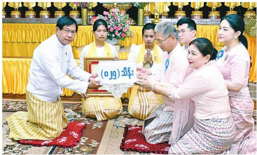
ဆံတော်ရှင်ဆူးလေစေတီ တော် ရွှေထီးတော်၊ စေတီ တော်လုံးတော်ပြည့်နှင့် အရံ စေတီများအား ရွှေစင်၊ ရွှေပြား နှင့် မျက်ပါးရွှေသင်္ကန်းတော် များ ကပ်လှူပူဇော်ရေး အတွက် ပဉ္စမအကြိမ် လှူဒါန်းငွေများကို အလှူရှင် များက ပေးအပ်လှူဒါန်းရာ ရန်ကုန် တိုင်းဒေသကြီး ဝန်ကြီးချုပ် ဦးစိုးသိန်းက လက်ခံရယူခဲ့ခြင်း