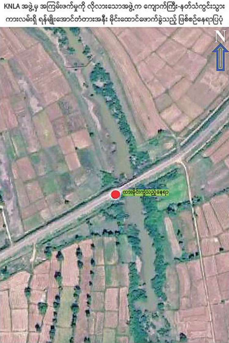
KNLA အဖွဲ့မှ အကြမ်းဖက်မှုကို လိုလားသောအဖွဲ့က ကျောက်ကြီး-နတ်သံကွင်းသွား ကားလမ်းရှိ ရန်မျိုးအောင်တံတားအနီး မိုင်းထောင်ဖောက်ခွဲသည့် ဖြစ်စဉ်နေရာပြပုံ