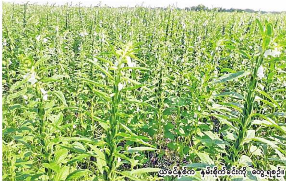
ယခင်နှစ်က နမ်းစိုက်ခင်းကို တွေ့ရစဉ်။

ရွှေဘို မတ် ၃၀ စစ်ကိုင်းတိုင်းဒေသကြီး ရွှေဘိုခရိုင် ရွှေဘိုမြို့နယ်တွင် နွေသီးနှံစိုက်ပျိုးရာသီ၌ နွေနှမ်းကေ ၁၀၀၀ ကျော် စိုက်ပျိုးပြီးစီးနေပြီဖြစ်ကြောင်း ရွှေဘိုမြို့နယ် စိုက်ပျိုးရေးဦးစီးဌာနမှ သိရသည်။