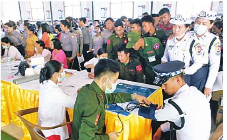
အလယ်ပိုင်းတိုင်းစစ်ဌာနချုပ်မှ အရာရှိ၊ စစ်သည်၊ မိသားစုဝင်များနှင့် ဒေသခံပြည်သူများက စုပေါင်းသွေးလှူဒါန်းစဉ်

တိုင်းစစ်ဌာနချုပ် (ယာယီအရေးပေါ်ကုသရေးဆေးရုံ) ကိုစစ်ကုသရေးစင်တာ၌ တိုင်းစစ်ဌာနချုပ်ကွပ်ကဲမှုအောက် တပ်ရင်း၊ တပ်ဖွဲ့များမှ အရာရှိ၊ စစ်သည်၊ မိသားစုဝင်များနှင့် စေတနာရှင်သွေးအလှူရှင် စုစုပေါင်း ဦးရေ ၄၄၀ တို့ကလည်းကောင်း အသီးသီး စုပေါင်းသွေးလှူဒါန်းကြသည်။ ဦးစွာ သွေးလှူဒါန်းမည့်သူများသည် ကျန်းမာရေးဆေးစစ်ခြင်း၊ သွေးပေါင်ချိန်စစ်ဆေးခြင်းနှင့် လိုအပ်သည်စစ်ဆေးမှုများခံယူကြပြီး သက်ဆိုင်ရာအသီးသီး၌ စုပေါင်းသွေးလှူဒါန်းကြသည်။ ထိုသို့ သွေးလှူဒါန်းနေမှုများကို သက်ဆိုင်ရာ တိုင်းစစ်ဌာနချုပ်များမှ တိုင်းမှူးများနှင့် တာဝန်ရှိသူများက လိုက်လံကြည့်ရှုအားပေးပြီး သွေးအလှူရှင်များအတွက် အာဟာရဖြည့်စားသောက်ဖွယ်ရာများနှင့် အားဆေးများ ထောက်ပံ့ပေးအပ်ခဲ့ကြောင်း သတင်းရရှိသည်။