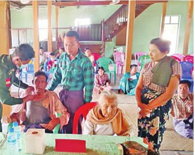
အလယ်ပိုင်းတိုင်း စစ်ဌာနချုပ် နယ်မြေခံဆေးကုသရေး အဖွဲ့က မကွေးတိုင်းဒေသကြီး မကွေးမြို့နယ် ကျစ်စုံဗွေးကျေးရွာ အတွင်းရှိ ဒေသခံပြည်သူများကို ကျန်းမာရေးစောင့်ရှောက်မှု လုပ်ငန်းများ ဆောင်ရွက်ပေးစဉ်။

စောင့်ရှောက်မှု လုပ်ငန်းများ ဆောင်ရွက်ပေးသည်။