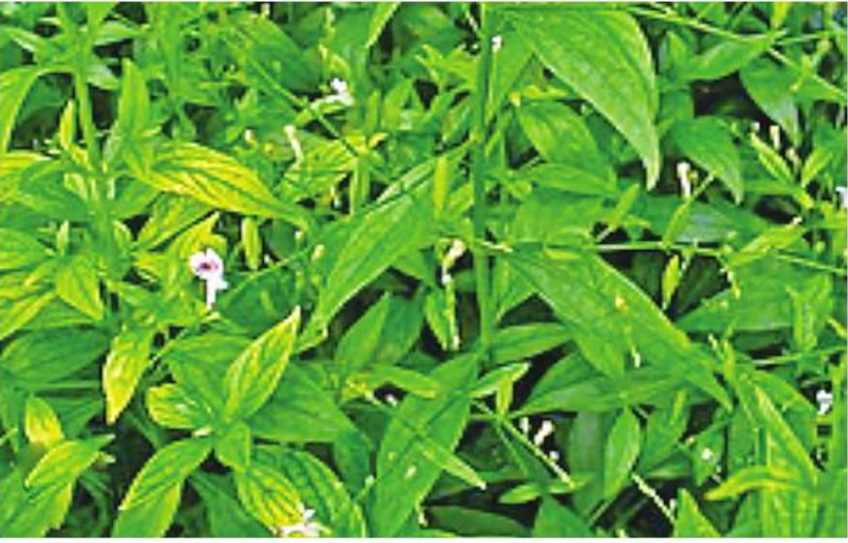
ဆေးဖက်ဝင် ဆေးခါးကြီးပင်ကို တွေ့ရစဉ်။

ပြီး ဦးနှောက်ဆီကို ငှက်ဖျားပိုးရောက် ရှိတာ မေ့မြောတာနဲ့ သေဆုံးတဲ့ထိဖြစ် နိုင်ပါတယ်။ အထက်ပါ လေ့လာတွေ့ရှိချက်တွေ ကြောင့် ငှက်ဖျားရောဂါက စိမ့်ရေစမ်းရေ သောက်သုံးပြီး ရရှိလာတဲ့ ရောဂါမျိုး မဟုတ်ပါ။ နှစ်ပေါင်းများစွာကြာမှ ဦးနှောက်ထဲကို ငှက်ဖျားပိုးရောက်ပြီး တစ်ကျော့ပြန် ငှက်ဖျားရောဂါဖြစ်စေနိုင် လို့ ရခိုင်ငှက်ပျောသီး၊ တောငှက်ပျော သီးတွေ စားမိချိန်နဲ့တိုက်ဆိုင်ရင်အထင် လွဲမှားစေနိုင်ပါတယ်။ ငှက်ဖျားရောဂါက တိုင်းရင်းဆေးပညာအလိုအရ ချမ်းတုန် ပြီး တက်ဖျား၊ ကျဖျား ဖျားတဲ့ရောဂါမျိုး ဖြစ်ပါတယ်။ ဥက္ကတေလော(ပူ၍ ဖျားခြင်း) နဲ့ သီတတေလော(အေး၍ ဖျားခြင်း) နှစ် မျိုးစလုံး တစ်ပြိုင်တည်းဖြစ်တတ်တဲ့ အဖျားမျိုးဖြစ်ပါတယ်။ အဖျားဆေး၊ ကိုယ်ပူကျဆေးတွေအပြင် ငန်းဆေး၊ မန်းဆေးတွေပါပေးပြီး ကုသရတဲ့ အဖျား မျိုးဖြစ်ပါတယ်။