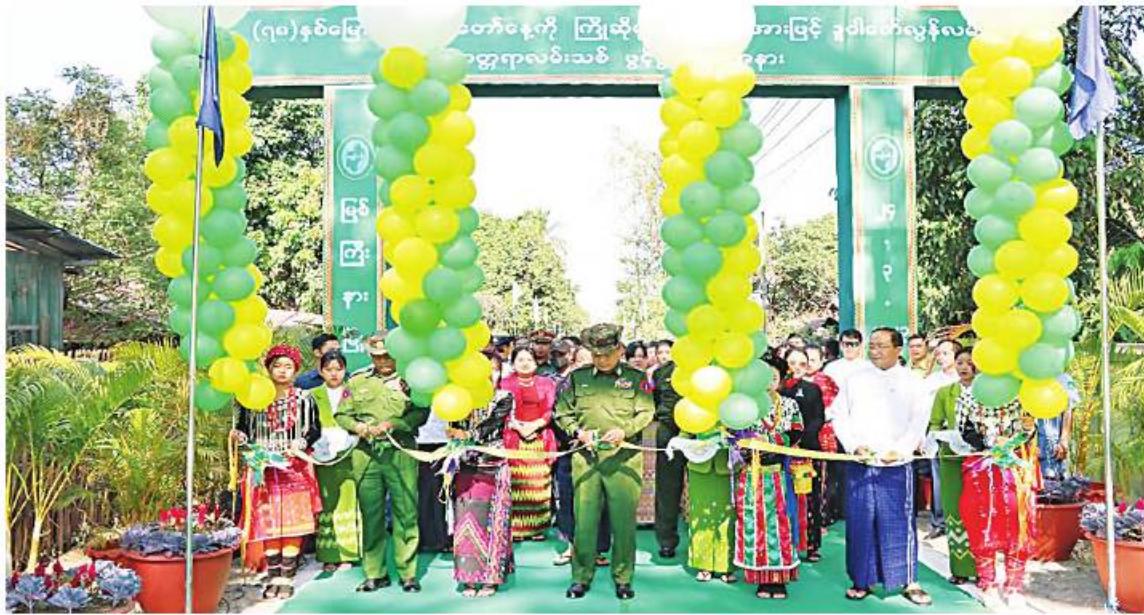
မြောက်ပိုင်းတိုင်းစစ်ဌာနချုပ် တိုင်းမှူး ဝိုလ်ချုပ်ကိုကိုမောင်နှင့် တာဝန်ရှိသူများက မြစ်ကြီးနားမြို့ တပ်ကုန်းရပ်ကွက် ဒူဝါဇော်လွန်လမ်း ကတ္တရာလမ်းသစ်ကို ဖဲကြိုးဖြတ်ဖွင့်လှစ်ပေးစဉ်

နေပြည်တော် မတ် ၂၄ (၇၈)နှစ်မြောက် တပ်မတော်နေ့ကို ဂုဏ်ပြုကြိုဆိုသောအားဖြင့် ၂၀၂၂-၂၀၂၃ ဘဏ္ဍာနှစ် ကချင်ပြည်နယ်အစိုးရအဖွဲ့ ရန်ပုံငွေဖြင့်ဆောင်ရွက်ခဲ့သည့် ကချင်ပြည်နယ် မြစ်ကြီးနားမြို့ တပ်ကုန်းရပ်ကွက် ဒူဝါဇော်လွန်လမ်း ကတ္တရာလမ်းသစ်ဖွင့်ပွဲကို ယနေ့နံနက်ပိုင်းတွင် အဆိုပါနေရာ၌ပြုလုပ်ရာ မြောက်ပိုင်းတိုင်းစစ်ဌာနချုပ် တိုင်းမှူး ဝိုလ်ချုပ်ကိုကိုမောင်နှင့် အဖွဲ့ဝင်များ၊ ဌာနဆိုင်ရာတာဝန်ရှိသူများ မြို့မိမြို့ဖ များနှင့် ဒေသခံပြည်သူများတက်ရောက်