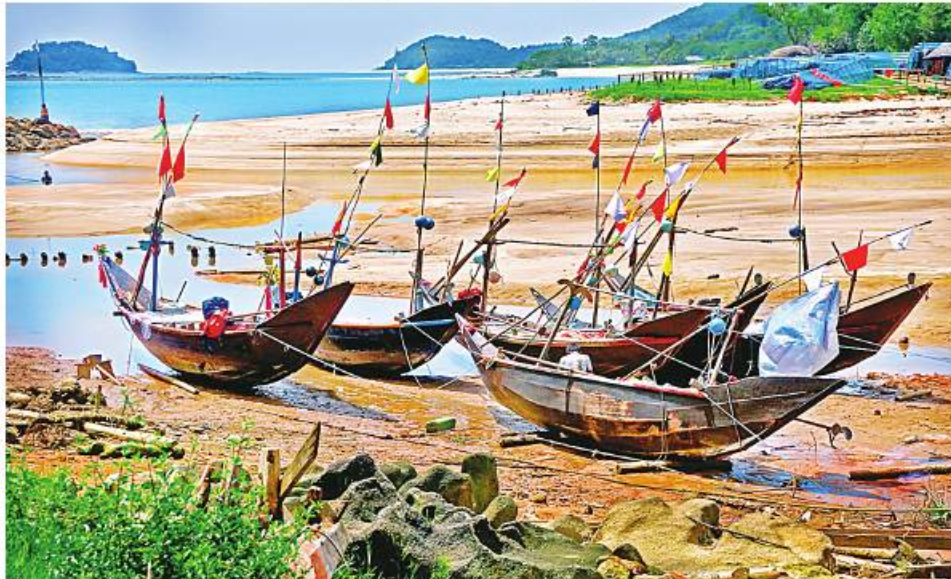
စစ်တွေ မတ် ၂၄