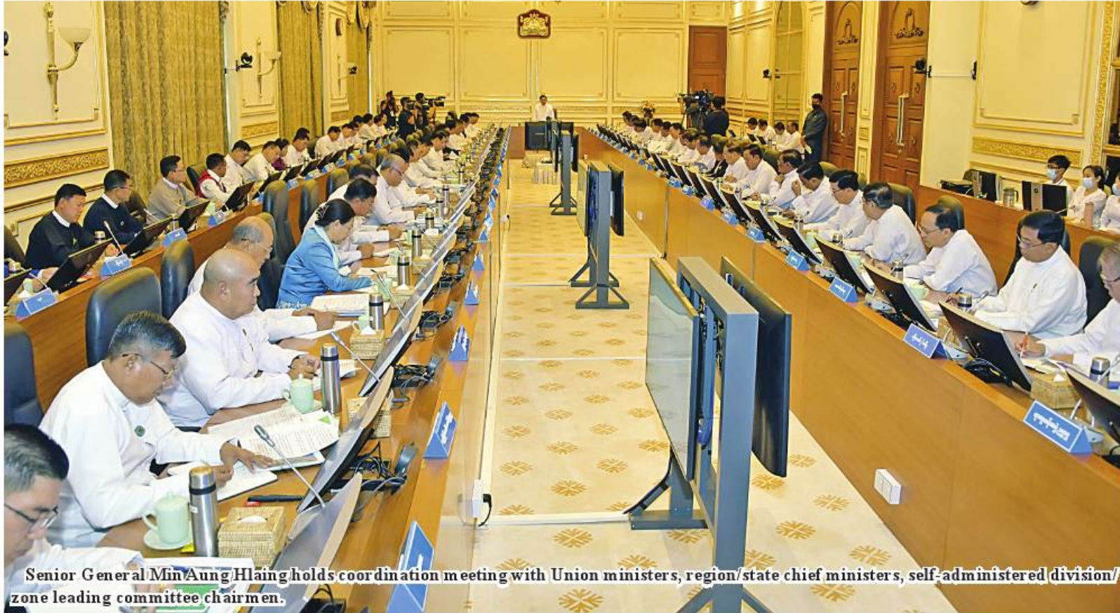
Senior General Min Aung Hlaing holds coordination meeting with Union ministers, region/state chief ministers, self-administered division/zone leading committee chairmen.