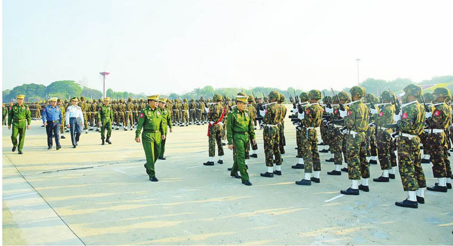
နိုင်ငံတော်စီမံအုပ်ချုပ်ရေးကောင်စီဒုတိယဥက္ကဋ္ဌ ဒုတိယတပ်မတော်ကာကွယ်ရေးဦးစီးချုပ် ကာကွယ်ရေးဦးစီးချုပ်(ကြည်း) ဒုတိယဗိုလ်ချုပ်မှူးကြီးစိုးဝင်း၊ ၂၀၂၃ ခုနှစ် မတ် ၂၇ ရက်တွင်ကျရောက်မည့် (၇၈)နှစ်မြောက် တပ်မတော်နေ့စစ်ရေးပြအခမ်းအနားတွင် ပါဝင်ချီတက်စစ်ရေးပြကြမည့် စစ်ရေးပြစစ်ကြောင်းကြီးများ ဝတ်စုံပြည့်စစ်ရေးပြလေ့ကျင့်နေမှုကို ကြည့်ရှုစစ်ဆေးစဉ်။

နေပြည်တော် မတ် ၂၄ ၂၀၂၃ ခုနှစ် မတ် ၂၇ ရက်တွင် ကျရောက်မည့် (၇၈)နှစ်မြောက် တပ်မတော်နေ့ စစ်ရေးပြအခမ်းအနားတွင် ပါဝင်ချီတက်စစ်ရေးပြကြမည့် စစ်ရေးပြ စစ်ကြောင်းကြီးများသည် ယနေ့နံနက်ပိုင်းတွင် နေပြည်တော် စစ်ရေးပြကွင်း၌ ဝတ်စုံပြည့်စစ်ရေးပြ လေ့ကျင့်မှုများ ဆောင်ရွက်ကြသည်။ စစ်ရေးပြလေ့ကျင့်မှုတွင် အနော်ရထာစစ်ကြောင်း၊ ကျွန်စစ်သားစစ်ကြောင်း၊ ဘုရင့်နောင်စစ်ကြောင်း၊ အောင်ဇေယျစစ်ကြောင်း၊ ဆင်ဖြူရှင်စစ်ကြောင်း၊ ဗန္ဓုလစစ်ကြောင်းနှင့် အောင်ဆန်းစစ်ကြောင်းများ ပါဝင်ပြီး စုရပ်ဖြစ်သည့်သစ်တပ်ကွင်းမှ စစ်ရေးပြကွင်းသို့ တပ်မတော်စစ်တီးဝိုင်းအဖွဲ့များ၏ တီးခတ်မှုနှင့်အတူ စစ်ချီသီချင်းများသီဆို၍ ညီညာစွာချီတက်ကြပြီး စစ်ရေးပြအခမ်းအနားအစီအစဉ်အတိုင်း လေ့ကျင့်ဆောင်ရွက်ကြသည်။ စာမျက်နှာ ၁၉ ကော်လံ ၁ ☆