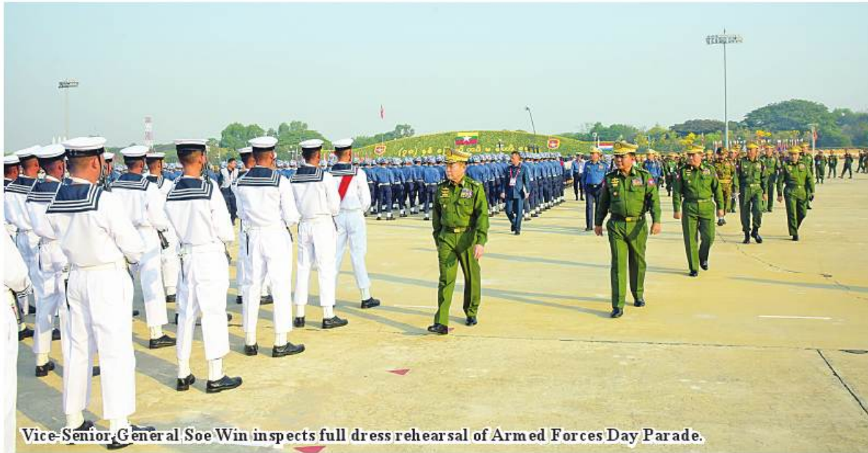
Vice-Senior General Soe Win inspects full dress rehearsal of Armed Forces Day Parade.

Nay Pyi Taw March 24 The parade columns who will be participating in the parade of the 78 th Anniversary of Armed Forces Day which falls on March 27, 2023 had a full-dress rehearsal this morning at the