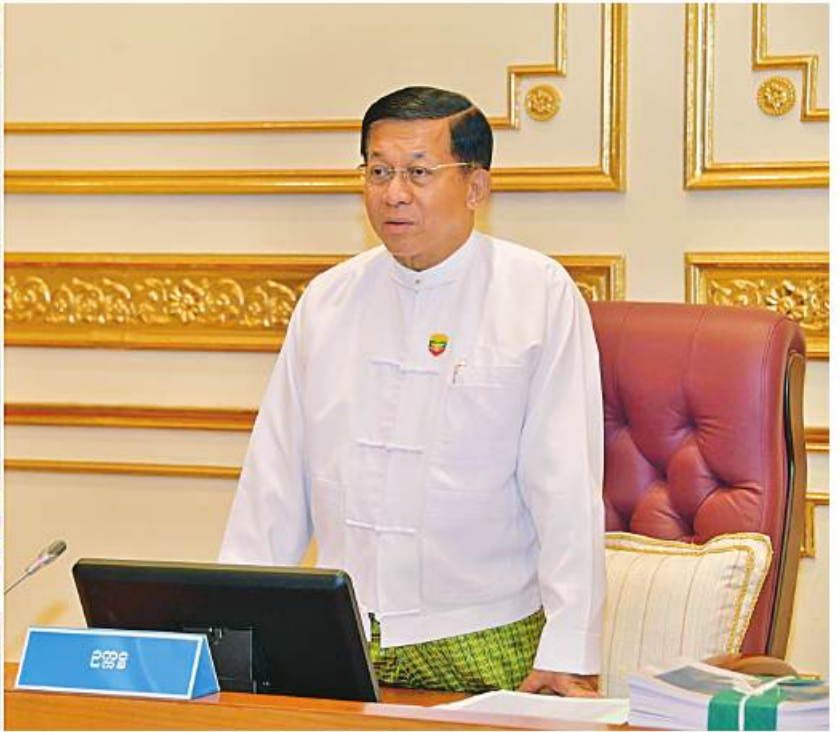
နိုင်ငံတော်စီမံအုပ်ချုပ်ရေးကောင်စီဥက္ကဋ္ဌ နိုင်ငံတော်ဝန်ကြီးချုပ် ဗိုလ်ချုပ်မှူးကြီးမင်းအောင်လှိုင် ကောင်စီအဖွဲ့ဝင်များ၊ ပြည်ထောင်စုဝန်ကြီးများ၊ တိုင်းဒေသကြီးနှင့် ပြည်နယ်ဝန်ကြီးချုပ်များ၊ ကိုယ်ပိုင်အုပ်ချုပ်ခွင့်ရ တိုင်း၊ ဒေသစီမံအုပ်ချုပ်ရေးအဖွဲ့ဥက္ကဋ္ဌများနှင့် တွေ့ဆုံညှိနှိုင်းအစည်းအဝေးတွင် အမှာစကားပြောကြားစဉ်။

နေပြည်တော် မတ် ၂၄ နိုင်ငံတော်စီမံအုပ်ချုပ်ရေးကောင်စီ ဥက္ကဋ္ဌ နိုင်ငံတော်ဝန်ကြီးချုပ် ဗိုလ်ချုပ်မှူးကြီးမင်းအောင်လှိုင် သည် ကောင်စီအဖွဲ့ဝင်များ၊ ပြည်ထောင်စုဝန်ကြီးများ၊ တိုင်းဒေသကြီးနှင့် ပြည်နယ်ဝန်ကြီးချုပ်များ၊ ကိုယ်ပိုင်အုပ်ချုပ်ခွင့်ရ တိုင်း၊ ဒေသစီမံအုပ်ချုပ်ရေး အဖွဲ့ဥက္ကဋ္ဌများနှင့် တွေ့ဆုံညှိနှိုင်းအစည်းအဝေးကို