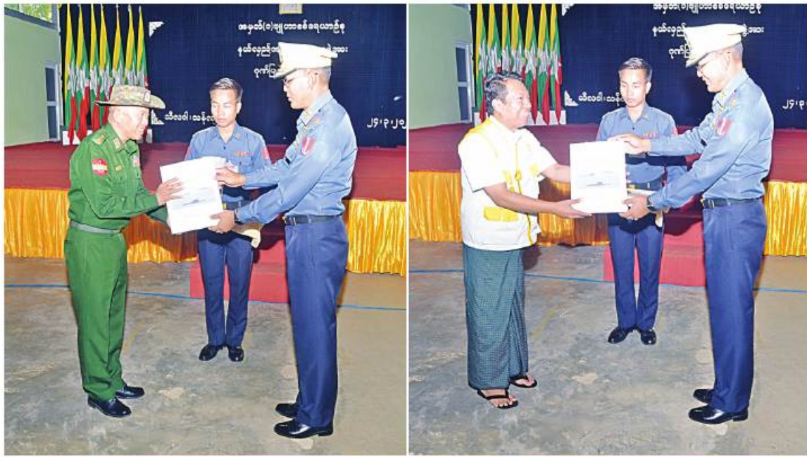
တပ်မတော်ကာကွယ်ရေးဦးစီးချုပ် ဝိုင်းလှိုင်ထွန်းက ရက်ပြပေးအပ်ရုံဖြင့်သော လက်ဆောင်ပစ္စည်းများကို တပ်မတော်ကာကွယ်ရေးဦးစီးချုပ်ကိုယ်စား ဝိုင်းလှိုင်ထွန်းက တပ်မတော်နှင့် ကျန်းမာရေးဝန်ကြီးဌာနတို့မှ အထူးကုဆေးအဖွဲ့ဝင်များထံ ပေးအပ်ခဲ့ခြင်း