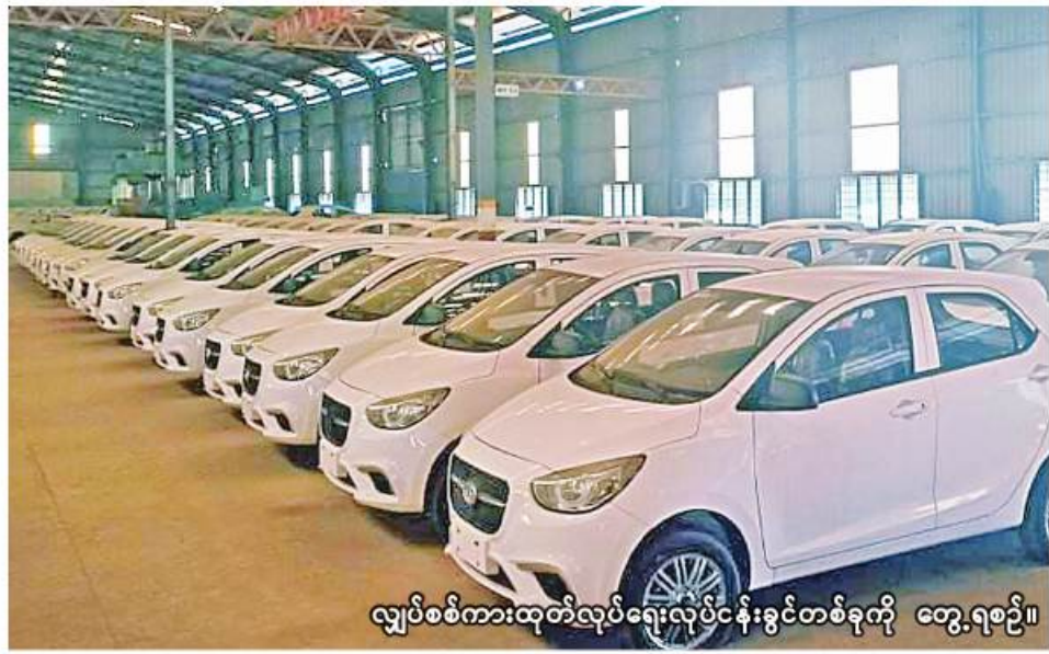
လျှပ်စစ်ကားထုတ်လုပ်ရေးလုပ်ငန်းခွင်တစ်ခုကို တွေ့ရစဉ်။

ရန်ကုန် မတ် ၂၄ မြန်မာနှင့် တရုတ်နိုင်ငံ ချုံချင့် ဒေသတို့ကြား လျှပ်စစ်သုံးယာဉ် ထုတ်လုပ်ခြင်းလုပ်ငန်း၊ စက်မှုလယ်ယာပစ္စည်း ထုတ်လုပ်ခြင်းလုပ်ငန်း၊ ကျန်းမာရေး စောင့်ရှောက်မှုလုပ်ငန်းကဏ္ဍများ တိုးမြှင့်ဆောင်ရွက် သွားမည်ဖြစ်ကြောင်း မြန်မာနိုင်ငံ ကုန်သည်များနှင့် စက်မှုလက်မှု လုပ်ငန်းရှင်များအသင်းချုပ် (UM-FCCI) အထွေထွေအတွင်းရေး