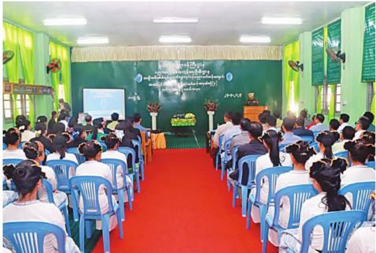
ရှမ်းပြည်နယ်(မြောက်ပိုင်း) လားရှိုးမြို့၌ အဆင့်မြင့်အိမ်တွင်းမှုစက်ချုပ်သင်တန်း အမှတ်စဉ်(၄) သင်တန်းဆင်းပွဲကျင်းပစဉ်

နေပြည်တော် မတ် ၂၄ နယ်စပ်ဒေသဖွံ့ဖြိုးရေးအစီအစဉ်အရ တိုင်းရင်းသားအမျိုးသမီးငယ်များ၏ လူနေမှုဘဝဖွံ့ဖြိုးတိုးတက်လာစေရန်၊ လူမှုစီးပွားဘဝတိုးတက်မြင့်မားလာစေရန်၊ အမျိုးသမီးများ အိမ်တွင်းမှုသက်မွေးလုပ်ငန်းပညာများကို တတ်မြောက်ကျွမ်းကျင်ပြီး ကိုယ်ပိုင်စီးပွားရေးလုပ်ငန်းများထူထောင်နိုင်သည့် အထိ လုပ်ကိုင်နိုင်ရန်ရည်ရွယ်၍ နယ်စပ်ရေးရာဝန်ကြီးဌာန ပညာရေးနှင့်လေ့ကျင့်ရေးဦးစီးဌာနက ဖွင့်လှစ်သင်ကြားပေးခဲ့သည့် အဆင့်မြင့်အိမ်တွင်းမှု စက်ချုပ်