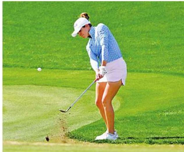
ပထမနေ့မှာ ဒီထက်ပိုကောင်းတဲ့ ရလဒ်ရသင့်ပါတယ်။ တချို့ကျင်းတွေမှာ နည်းနည်းလေးပေါ့မိတဲ့ အတွက် ရသင့်တဲ့ရလဒ်မျိုးမရခဲ့တာပါ။ ဘာပဲဖြစ်ဖြစ် လက်ရှိရထားတဲ့ ရလဒ်အပေါ်မှာ ဝမ်းသာဂုဏ်ယူပါတယ်” ဟု ပြောကြားခဲ့ကြောင်း AZL

လျက်ရှိသည်။ အလစ်ဆန်လီသည် ပထမနေ့၏ ကျင်းပပတ် (၅) အပြီးတွင် ရရှိခဲ့ပြီး ကစားသမားဘဝသက်တမ်းတစ်လျှောက်အကောင်းဆုံးပုံစံကို ရလဒ်ကို ရယူထားနိုင်ခဲ့သည်။ တောင်ကိုရီးယား ဂေါက်သီးရိုက်မယ် ဂျန်နီရှင်သည်လည်း ၂၀၁၆ ခုနှစ်နောက်ပိုင်းချန်ပီယံဆုဖလားများဖြင့် ဝေးကွာနေရသည့် အခြေအနေဖြင့် ရင်ဆိုင်နေရပြီး ဆုဖလားများဖြင့် ဝေးကွာနေရသည့် အခြေအနေမှ ရုန်းထွက်နိုင်ရေးအတွက် ပထမနေ့တွင် အကောင်းဆုံးယှဉ်ပြိုင်ကစားသွားခဲ့သည်။ မက္ကဆီကို ဂေါက်သီးရိုက်မယ် ဂါဘီလိုပက်င်သည် ပထမနေ့တွင် Birdie ရိုက်ချက် သုံးကျင်းသာရရှိခဲ့သော်လည်း Bogey Free ရခဲ့သည့်အတွက် အမှတ်ပေးဇယားထိပ်တွင် ပူးတွဲရပ်တည်ထားနိုင်ခြင်း