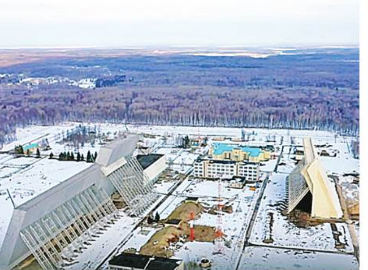
ခွင့်ပြုထားသည်။ ရုရှားနိုင်ငံကလည်း အဆိုပါလုပ်ငန်းမှုသည် ရုရှား၏ အမျိုးသားလုံခြုံရေးအကျိုးစီးပွားကိုထိခိုက်စေပြီး အမေရိကန်၏ ကာလရှည်ကြာမူဝါဒအပေါ် မဟာဗျူဟာစစ်ရေးဟန့်ချက်ညီမှုကို ချေဖျက်ရန်လုပ်ဆောင်ခဲ့သည့် ပထမဆုံးခြေလှမ်းအဖြစ် ဖော်ပြခဲ့သည်။ Moscow's missile defenses beefed up ကို ဘာသာပြန်ဆိုထားပါသည်။

ရုရှားနိုင်ငံ၏ ခေတ်မီဂြိုဟ်တုနှင့် ပဲ့ထိန်းဒုံးကျည် တန်ပြန်ကာကွယ်ရေးစနစ်များအတွက် ပစ်မှတ်သတင်းအချက်အလက်များကိုလည်း ပံ့ပိုးပေးနိုင်စွမ်းရှိသည်ဟု စစ်ဘက်ဆိုင်ရာကျွမ်းကျင်သူများက ယုံကြည်ကြသည်။ ဆိုဗီယက်ခေတ် ခေါင်းဆောင်များသည် ၁၉၇၂ ခုနှစ်တွင် အမေရိကန်နိုင်ငံနှင့် တန်ပြန်ပဲ့ထိန်းဒုံးကျည်ကာကွယ်ရေး (ABM) စာချုပ်ကို လက်မှတ်ရေးထိုးခဲ့စဉ်က ဖြစ်နိုင်ခြေရှိသော နျူကလီးယားတိုက်ခိုက်မှုမှကာကွယ်ရန် မော်စကိုမြို့ကို ရွေးချယ်ခဲ့ကြသည်။ အဆိုပါစာချုပ်တွင် နှစ်နိုင်ငံစလုံးသည် တန်ပြန်ပဲ့ထိန်းဒုံးကျည်ကာကွယ်ရေး (ABM) စနစ်များကိုအသုံးပြုခြင်းမပြုရန် တားမြစ်ထားပြီး ၎င်းတို့ကို အမေရိကန်နှင့် ဆိုဗီယက်တို့၏ နျူကလီးယားအဟန့်အတားကို အဆင့်လျှော့ချခြင်းအဖြစ် ရှုမြင်ထားသည်။ သို့သော်လည်း နိုင်ငံတစ်နိုင်ငံစီအတွက် ခြွင်းချက်တစ်ခုကို