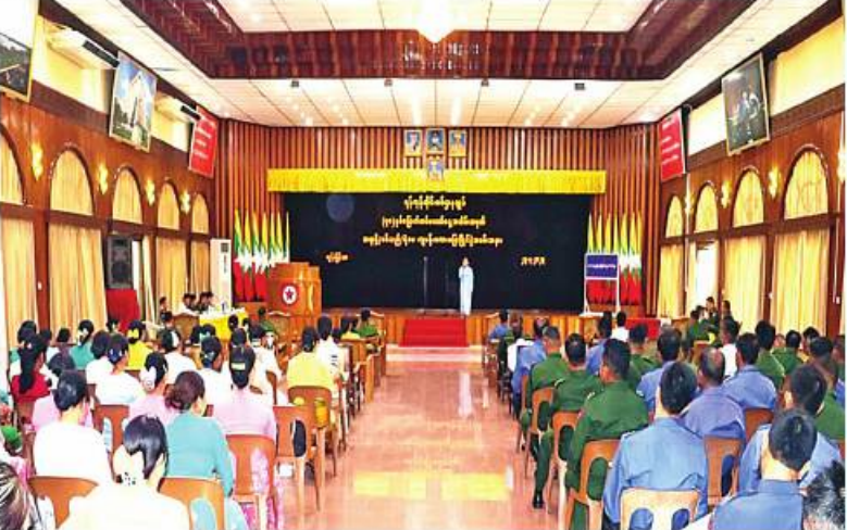
ရန်ကုန်တိုင်း စစ်ဌာနချုပ်၌ (၇၈)နှစ်မြောက် တပ်မတော်နေ့ အထိမ်းအမှတ် ကျပန်းစကားပြော ပြိုင်ပွဲ ကျင်းပစဉ်။

ပြောဆို၊ စစ်သည်၊ မိသားစုဝင်များ ၏ ကျပန်းစကားပြောယှဉ်ပြိုင်ပွဲနေ့မှ များကို ကြည့်ရှုအားပေးသည်။ အဆိုပါ တိုင်းစစ်ဌာနချုပ်နှင့် ကွပ်ကဲမှုအောက် ဌာနချုပ် တပ်နယ်များမှ အရာရှိ၊ စစ်သည်၊ မိသားစုဝင်ဦးရေ ၅၀ ဖြင့် ကျင်းပ ပြုလုပ်ခဲ့ကြောင်း သတင်းရရှိသည်။