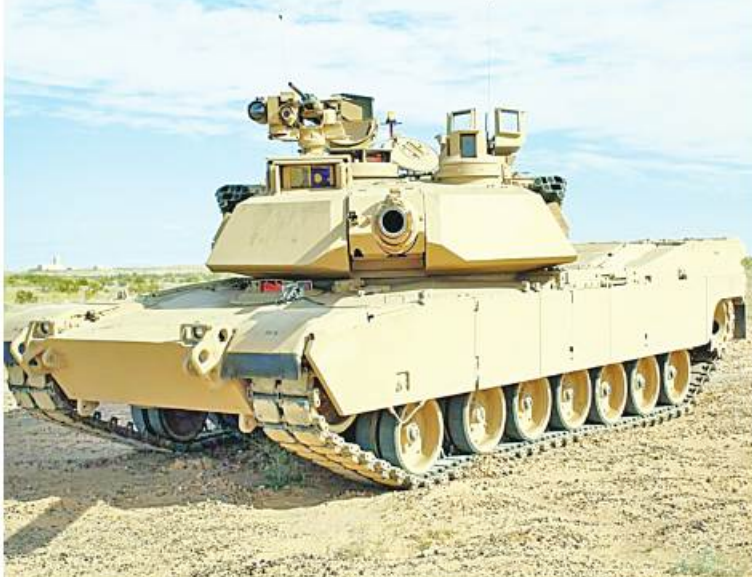
ယူကရိန်းနိုင်ငံသည် ၂၀၂၃ ခုနှစ် ဆောင်းဦးရာသီတွင် M1A1 Abrams တင့်ကားများကို အမေရိကန်နိုင်ငံက ပို့ဆောင်ပေးမည်ဖြစ်ပြီး မျှော်လင့်ထားသည်

ထက် သိသိသာသာမြန်ဆန်နေချိန်တွင် Patriot လေကြောင်းရန်ကာကွယ်ရေးစနစ်များကိုလည်း စောနိုင်သမျှစောစွာ တင်ပို့နိုင်မည်ဖြစ်ကြောင်း ပင်တဂွန်စစ်ဌာနချုပ်က မတ် ၂၁ ရက်တွင် ထုတ်ဖော်ပြောကြားခဲ့သည်။ ယူကရိန်းနိုင်ငံနှင့် ညှိနှိုင်းဆောင်ရွက်ရာတွင် အမေရိကန်နိုင်ငံသည် Abrams တင့်ကား၏ M1A1 ဗားရှင်းကို ပံ့ပိုးပေးအပ်ရန်ဆုံးဖြတ်ခဲ့သည်ဟု သတင်းစာရှင်းလင်းပွဲတွင် အတွင်းရေးမှူး ဝိုင်းမူးချုပ် Pat Ryder က သတင်းထောက်များကို ပြောကြားခဲ့သည်။ ဤအရာက “ကျွန်ုပ်တို့ကို ပို့ဆောင်မှုအချိန်ကာလကို သိသာထင်ရှားစွာ အရှိန်မြှင့်လုပ်ဆောင်နိုင်စေပြီး ယခုနှစ်ဆောင်းဦးရာသီအချိန်မှာ ယူကရိန်းကို အရေးကြီးတဲ့စွမ်းဆောင်ရည်တွေကို ပေးအပ်နိုင်တော့