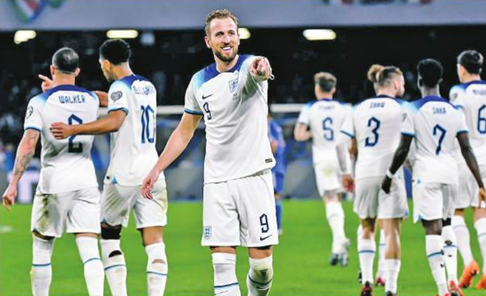
လန်ဒန် မတ် ၂၄

ယူရို ၂၀၂၄ ခြေစစ်ပွဲ အဖြစ် ယနေ့နံနက်ပိုင်းက ကစားခဲ့သည့် အီတလီအသင်းနှင့်အင်္ဂလန်အသင်းတို့ပွဲစဉ်တွင် အင်္ဂလန်အသင်းက နှစ်ပိုင်း တစ်ပိုင်းဖြင့် အနိုင်ရရှိခဲ့ပြီးနောက် ဆယ်စုနှစ်