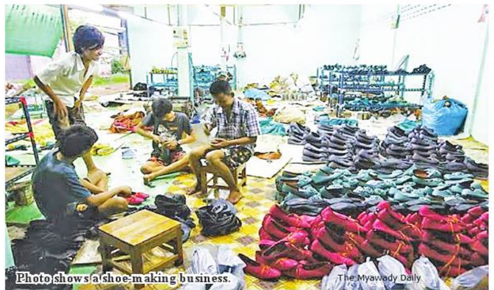
Photo shows a shoe-making business.