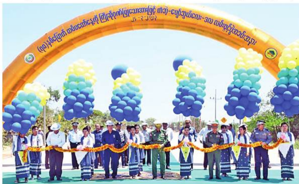
ရန်ကုန်တိုင်းစစ်ဌာနချုပ် တိုင်းမှူး ဗိုလ်ချုပ်ညွန့်ဝင်းဆွေနှင့် တာဝန်ရှိသူများက (၇၈)နှစ်မြောက် တပ်မတော်နေ့ကို ကြိုဆိုရက်ပြုသောအားဖြင့် ရန်ကုန်တိုင်းဒေသကြီး တုံ့တေးမြို့နယ်နှင့် ဒလမြို့နယ်တို့ရှိ ကံဘဲ့-ပျော်ဘွယ်လေး-ဒလလမ်းသစ်ကို ဖဲကြီးဖြတ်ဖွင့်လှစ်ပေးစဉ်။

နေပြည်တော် မတ် ၂၄ (၇၈)နှစ်မြောက် တပ်မတော်နေ့