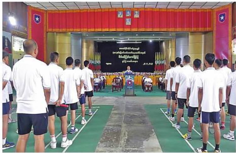
အလယ်ပိုင်းတိုင်း စစ်ဌာနချုပ် တိုင်းမှူး ဗိုလ်ချုပ်ကိုကိုဦး (၇၈)နှစ်မြောက် တပ်မတော်နေ့ အထိမ်းအမှတ် ဖိတ်ခေါ် ကြက်တောင်ပြိုင်ပွဲ ဖွင့်ပွဲအခမ်းအနားတွင် အမှာစကား ပြောကြားစဉ်။

နေပြည်တော် မတ် ၂၄ (၇၈)နှစ်မြောက် တပ်မတော်နေ့ အထိမ်းအမှတ်အဖြစ် ဖိတ်ခေါ် ကြက်တောင်ပြိုင်ပွဲ ဖွင့်ပွဲကို ယနေ့ နံနက်ပိုင်းတွင် အလယ်ပိုင်းတိုင်း စစ်ဌာနချုပ်ရှိ ရန်အောင်မြင်ခန်းမ ချိပြုလုပ်ရာ တိုင်းမှူး ဗိုလ်ချုပ် ကိုကိုဦးနှင့်အဖွဲ့ဝင်များ၊ ဒိုင်အဖွဲ့ ဝင်များ၊ ပြိုင်ပွဲဝင်အားကစားသမား