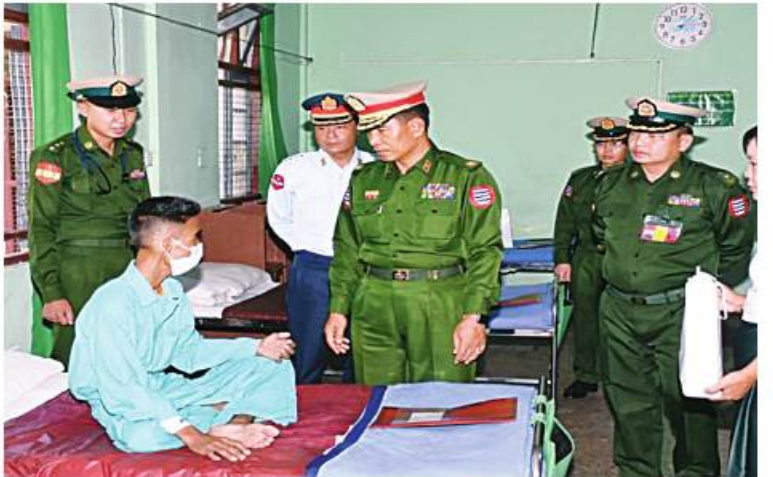
အနောက်တောင်တိုင်းစစ်ဌာနချုပ် တိုင်းမှူး ဝိုလ်ချုပ်ကြည်ခိုင် ဆေးကုသမှုခံယူနေသူတစ်ဦးကို ရင်းရင်းနှီးနှီး မေးမြန်းအားပေးစကားပြောကြားစဉ်

နှင့် ဒေသခံပြည်သူများကို ယနေ့တွင် သက်ဆိုင်ရာ တိုင်းစစ်ဌာနချုပ်အသီးသီးမှ တိုင်းမှူးများနှင့်တာဝန်ရှိသူများက သွားရောက်ကြည့်ရှု၍ တစ်ဦးချင်း၏ ရောဂါဖြစ်ပွားမှု၊ ဆေးကုသပေးထားမှုနှင့်ကျန်းမာရေး တိုးတက်မှုအခြေအနေများကို ရင်းရင်းနှီးနှီး မေးမြန်း အားပေးစကားပြောကြားပြီး ဆေးရုံတက်လူနာများကို အာဟာရဖြည့်စားသောက်ဖွယ်ရာများ ပေးအပ်သည်။ ထို့နောက် တိုင်းမှူးများနှင့် အဖွဲ့ဝင်များသည် ဆေးရုံများအတွင်း လှည့်လည်ကြည့်ရှုပြီး လိုအပ်သည်များ ညှိနှိုင်းဆောင်ရွက်ပေးခဲ့ကြောင်း သတင်းရရှိသည်။