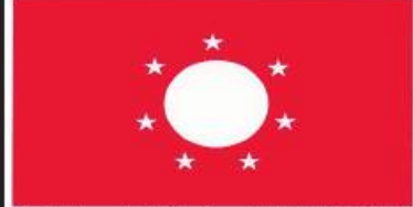
ကိုးကန့်ဒီမိုကရေစီနှင့် ညီညွတ်ရေးပါတီ (KKDUP)၏ တံဆိပ်ပုံစံ