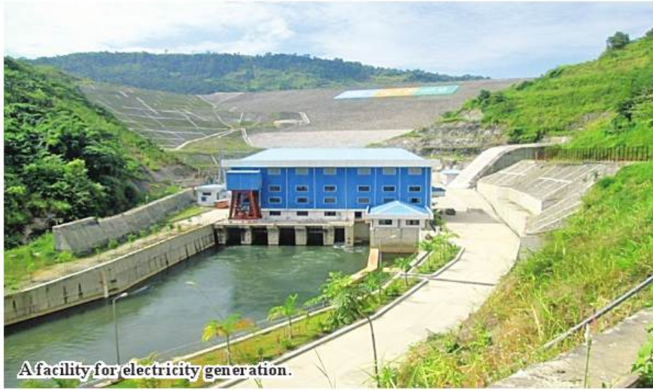
A facility for electricity generation.

Bago March 23 If electrification has been completed in western Bago Region in 2022-23 fiscal year, more than 2,400 towns and villages in the region will have supply of electricity, according to the Ministry of Electric Power. The National Electrifi-