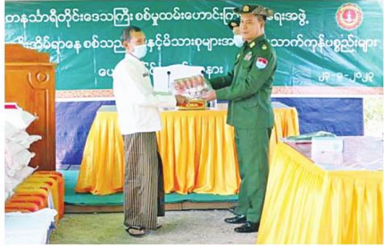
ကမ်းရိုးတန်းဒေသတိုင်းစစ်ဌာနချုပ် တိုင်းမှူး ဗိုလ်ချုပ်စောသန်းလှိုင် စစ်မှုထမ်းဟောင်း အဖွဲ့ဝင်များအတွက် ဆန်၊ဆီနှင့်စားသောက်ဖွယ်ရာများ ပေးအပ်စဉ်။

နေပြည်တော် မတ် ၂၃ တနင်္သာရီတိုင်းဒေသကြီး ထားဝယ် မြို့နယ်အတွင်းရှိ မြို့နယ်စစ်မှုထမ်းဟောင်း အဖွဲ့ဝင်များ၊ စစ်မှုထမ်းဟောင်းအိမ်ရာနေ စစ်သည်များနှင့် မိသားစုဝင်များကို ယနေ့ နံနက်ပိုင်းတွင် ကမ်းရိုးတန်းဒေသတိုင်းစစ် ဌာနချုပ် တိုင်းမှူး ဗိုလ်ချုပ်စောသန်းလှိုင်နှင့် တာဝန်ရှိသူများက အဆိုပါအိမ်ရာ၌ သွား ရောက် တွေ့ဆုံအမှာစကားပြောကြားပြီး စစ်မှုထမ်းဟောင်းအဖွဲ့ဝင်များ၏တင်ပြချက် များအပေါ် လိုအပ်သည်များ ညှိနှိုင်းဆောင် ရွက်ပေးသည်။ ထို့နောက် တိုင်းမှူးနှင့်တာဝန်ရှိသူများက