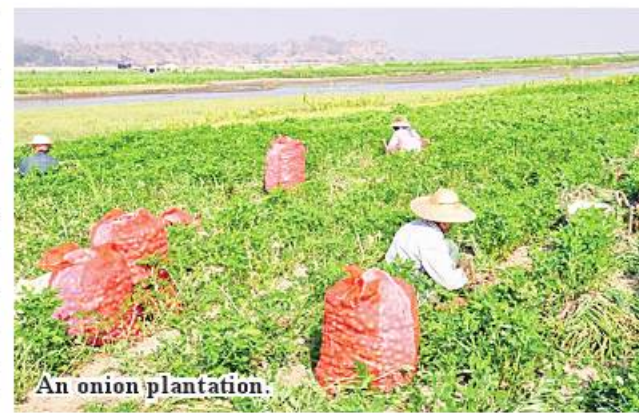
An onion plantation.