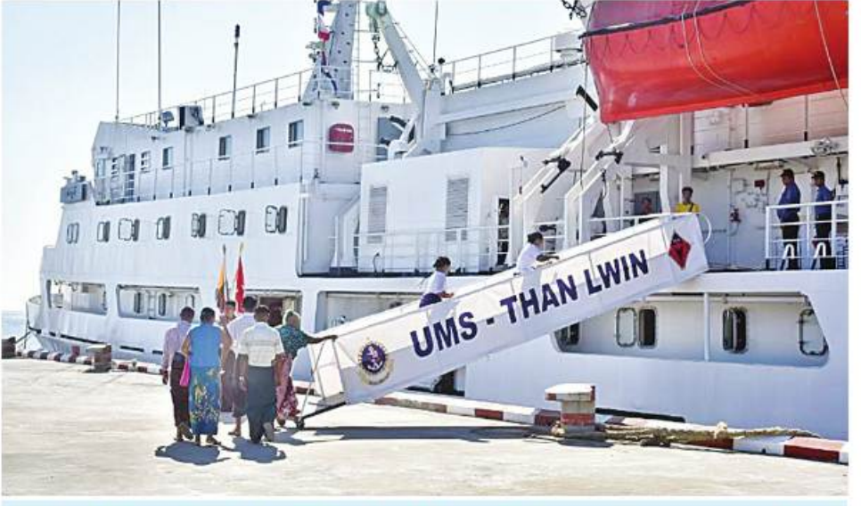
ရန်ကုန်တိုင်းဒေသကြီး ကိုကိုးကျွန်းမြို့နယ်အတွင်းရှိ ဒေသခံပြည်သူများအား ဆေးကုသမှုပေးရန်အတွက် တပ်မတော်ပင်လယ်သွားဆေးရုံရေယာဉ်(သံလွင်)ပေါ်သို့ လာရောက်ကြစဉ်။

တို့ ကျွန်းနေပြည်သူတွေကိုလဲ သေချာဂရုစိုက်ကုသပေးပါတယ်။ စားရေး၊ သောက်ရေး၊ နေရေး၊ ထိုင်ရေးကိုလဲ ဂရုစိုက်ပေးပါတယ်။ အခုလိုဆေးကုသပေးမှုတွေကိုလဲ မကြာခဏ လာရောက်ပေးစေလိုပါတယ်။ အခုလိုပါရဂူတွေအများကြီးပါတဲ့ သံလွင်ဆေးကုသဘော်ကြီး လာရောက်ဆေးကုသပေးတဲ့အတွက် ပါရဂူကြီးတွေနဲ့ ဆရာဝန်၊ ဆရာမတွေကိုလဲ အထူးပဲကျေးဇူးတင်ပါတယ်။ နိုင်ငံတော်အကြီးအကဲကိုလဲ အထူးပဲကျေးဇူးတင်ရှိပါတယ်။ ပြောကြားလိုပါတယ်”ဟု ဒေသခံတစ်ဦးက ပြောပြသည်။ “ကျွန်မကတော့ ကျန်းမာရေးမရှိဘူး။ ကျန်းမာရေးမရှိဘူးဆိုရင် ကျန်းမာရေးမရှိဘူးဆိုရင် အရမ်းခက်ခဲမှုရှိပါတယ်။ မြို့ပေါ်မှာရှိတဲ့ ဆရာဝန်၊ ဆရာမ နည်းပါးမှုရှိတဲ့အတွက် ရောဂါကြီးကြီးမားမားဖြစ်လာရင် အရမ်းခက်ခဲပါတယ်။ အခုလိုသံလွင်ဆေးကုသဘော်ကြီး လာရောက်ကုသပေးတော့ မျက်စိဆရာဝန်ကြီးတွေအရီးအကြောဆရာဝန်ကြီးတွေ၊ သားဖွားမီးယပ်ဆရာဝန်ကြီးတွေ၊ အထွေထွေရောဂါကုသပေးတဲ့ဆရာ