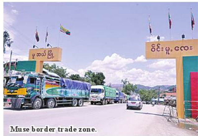
Muse border trade zone.

US$3.83 million of trade surplus. During the period, border trade camps in Myanmar-Thai border secured the largest amount of trade value among others. 336