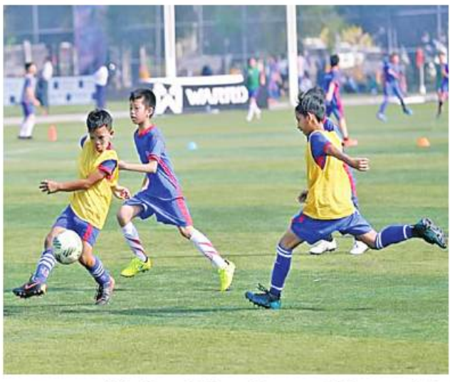
League 2023 ပြိုင်ပွဲကိုအပတ်စဉ် စနေနေ့နှင့် တနင်္ဂနွေနေ့တွင် ကျင်းပသွားမည်ဖြစ်ပြီး ပြိုင်ပွဲကာလ အဖြစ် ပထမအကျော့ပွဲစဉ်များကို သုံးလ၊ ဒုတိယအကျော့ပွဲစဉ်များကို သုံးလ စုစုပေါင်း ခြောက်လကြာ

မန္တလေးတိုင်းဒေသကြီး၊ စစ်ကိုင်း တိုင်းဒေသကြီးတို့မှ အသင်း နှစ်သင်းစီ၊ နေပြည်တော် ကောင်စီနယ်မြေ၊ မကွေးတိုင်း ဒေသကြီးတို့မှတစ်သင်းစီ၊ ရှမ်းပြည်နယ်မှ သုံးသင်း၊ ချင်းပြည်နယ်မှ တစ်သင်း၊ ကယားပြည်နယ်မှ တစ်သင်း၊ ကချင်ပြည်နယ်မှ တစ်သင်း ပါဝင်မည်ဖြစ်သည်။ အလားတူ အောက်မြန်မာပြည် ရန်ကုန်အဖြစ် ကျင်းပမည့် ရန်ကုန်မြို့ တွင် ရန်ကုန်တိုင်းဒေသကြီးမှ သုံးသင်း၊ ပဲခူးတိုင်းဒေသကြီးမှ နှစ်သင်း၊ ဧရာဝတီတိုင်းဒေသကြီး မှ နှစ်သင်း၊ တနင်္သာရီတိုင်းဒေသ ကြီးမှ တစ်သင်း၊ မွန်ပြည်နယ်မှ နှစ်သင်း၊ ရခိုင်ပြည်နယ်မှတစ်သင်း၊ ကရင်ပြည်နယ်မှတစ်သင်း ပါဝင် မည်ဖြစ်သည်။ FIFA-MFF U-15 Youth