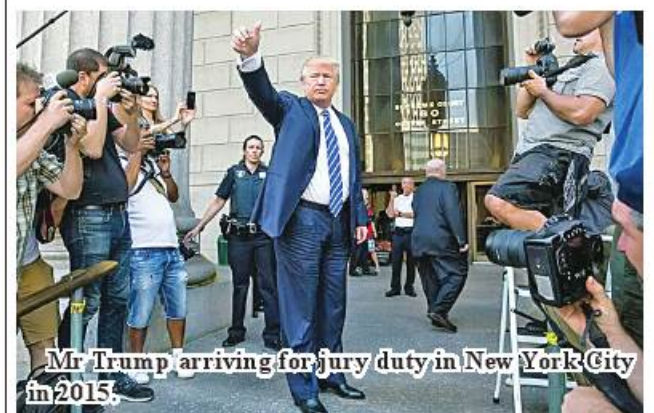
Mr Trump arriving for jury duty in New York City in 2015.