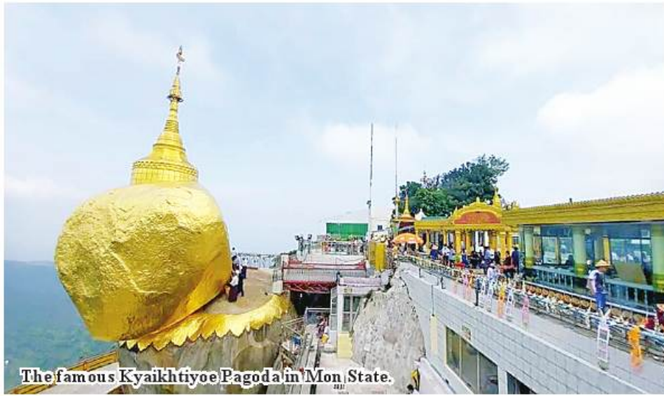
The famous Kyaikhtiyoe Pagoda in Mon State.