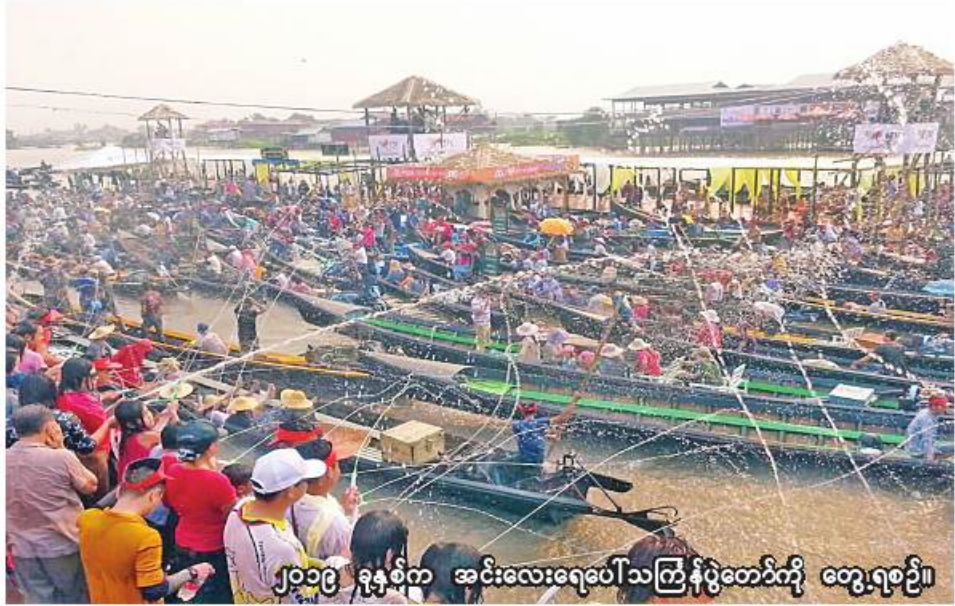
၂၀၁၉ ခုနှစ်က အင်းလေးရေပေါ်သင်္ကြန်ပွဲတော်ကို တွေ့ရစဉ်။

“ရှမ်းပြည်နယ်ဟာ ၂၀၂၂ ခုနှစ်နဲ့ ၂၀၂၃ ခုနှစ်တွေမှာ ခရီးသွားဧည့်သည်ဝင်ရောက်မှု မြင့်တက်နေတဲ့ ပြည်နယ်တစ်ခုဖြစ်ပါတယ်။ ၂၀၂၂ ခုနှစ် ဇန်နဝါရီလကနေ ၂၀၂၃ ခုနှစ် ဇန်နဝါရီလထိ ကာလအတွင်းမှာ ရှမ်းပြည်နယ်ကြီးတစ်ခုလုံးကို ခရီးသွားပြည်သူတစ်သန်းကျော် ဝင်ရောက်ခဲ့ပြီး တော့ ပြည်ပခရီးသွား ငါးသောင်းပါဝင်ပါတယ်။ ဒီလိုဝင်ရောက်ထားတဲ့အတွက် ခရီးသွားဝင်ရောက်မှုများပဲ အခုနှစ် သင်္ကြန်မှာတော့ တောင်ကြီး၊ ကလေး၊ အင်းလေး၊ အောင်ပန်း၊ ပင်းတယ၊ တာချီလိတ်၊ ကျိုင်းတုံ၊ နောင်ချို၊ သီပေါ၊ လားရှိုး၊ မူဆယ်တို့မှာ ရေကစားမဏ္ဍပ်တွေ၊ ဖျော်ဖြေရေးမဏ္ဍပ်တွေနဲ့ စည်စည်ကားကား ကျင်းပမှာဖြစ်ပါတယ်”ဟု ဦးထင်အောင်နိုင်က ပြောပြသည်။