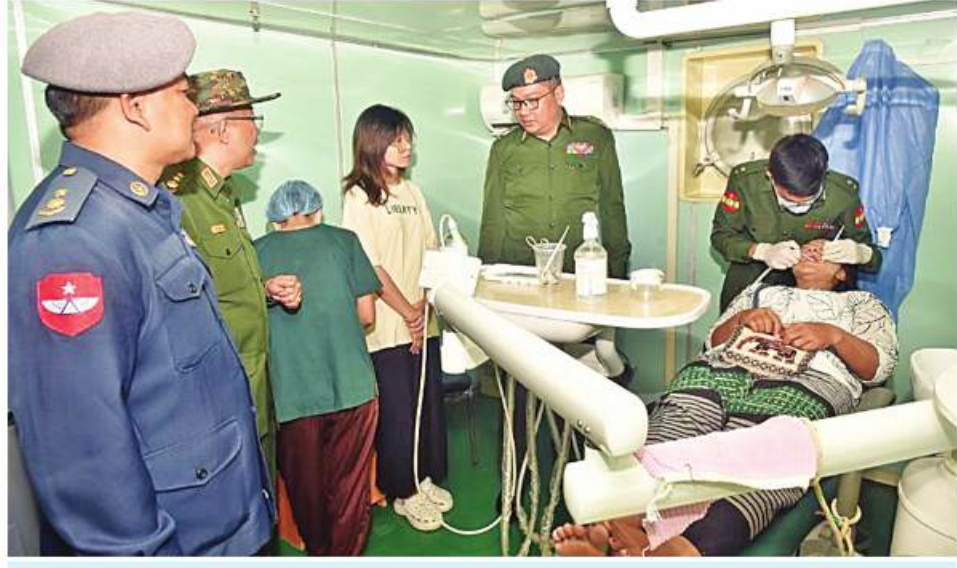
တပ်မတော်နှင့် ကျန်းမာရေးဝန်ကြီးဌာနတို့မှ နယ်လှည့်အထူးကုဆေးအဖွဲ့က ဒေသခံပြည်သူများအား ကျန်းမာရေးစောင့်ရှောက်မှုလုပ်ငန်းများ ဆောင်ရွက်ပေးနေမှုကို တာဝန်ရှိသူများက ကြည့်ရှုအားပေးစဉ်။

နေပြည်တော် မတ် ၂၃ ကမ်းရိုးတန်းဒေသ တစ်လျှောက်မှ ဒေသခံပြည်သူများကို ကျန်းမာရေးစောင့်ရှောက်မှုလုပ်ငန်းများ ဆောင်ရွက်ပေးရန်အတွက် တပ်မတော်နှင့်ကျန်းမာရေးဝန်ကြီးဌာနတို့မှ အထူးကုဆေးအဖွဲ့များမှ ပါရဂူများ၊ ဆေးမှူးများနှင့် သူနာပြုများလိုက်ပါလာသည့် တပ်မတော်ပင်လယ်သွားဆေးရုံရေယာဉ်(သံလွင်)သည် ယနေ့တွင် ရန်ကုန်တိုင်းဒေသကြီး ကိုကိုးကျွန်းမြို့နယ်ရှိ နယ်မြေခံရေတပ်အခြေစိုက်စခန်း ဆိပ်ခံတံတား၌အခြေပြု၍ ကိုကိုးကျွန်းမြို့နယ်အတွင်းရှိ ဒေသခံပြည်သူ ၁၀၈ ဦးကို ကျန်းမာရေး စောင့်ရှောက်မှုလုပ်ငန်းများ ဆက်လက်ဆောင်ရွက်ပေးကြသည်။ ထိုသို့ဆောင်ရွက်ပေးရာ ဆေးကုသမှုဆိုင်ရာရောဂါ ၅၁ ဦး၊ ခွဲစိတ်ရောဂါခြောက်ဦး၊ သားဖွားမီးယပ်ရောဂါ သုံးဦး၊ တလေးရောဂါ ငါးဦး၊ အရိုးရောဂါ ၁၃ ဦး၊ နား၊ နှာခေါင်း၊ လည်ချောင်းရောဂါ ငါးဦး၊ မျက်စိရောဂါ ၁၉ ဦးနှင့် သွားနှင့်ဆိုင်တွင်းရောဂါ ခြောက်ဦးတို့ကို လိုအပ်သည့် ဆေးဝါးကုသမှုများဆောင်ရွက်ပေးသည်။