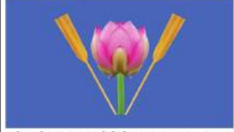
အင်းအမျိုးသားအဖွဲ့ချုပ်ပါတီ (Inn National League Party)၏ တံဆိပ်ပုံစံ