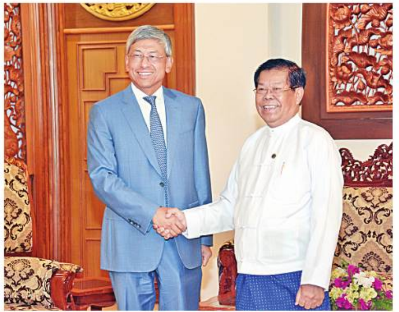
နိုင်ငံခြားရေးဝန်ကြီးဌာန ပြည်ထောင်စုဝန်ကြီး ဦးသန်းဆွေနှင့် မြန်မာနိုင်ငံ ဆိုင်ရာ တရုတ်ပြည်သူ့သမ္မတနိုင်ငံ သံအမတ်ကြီး မစ္စတာချန်းဟိုင်တို့ ရင်းရင်းနှီးနှီး နှုတ်ဆက်စဉ်။