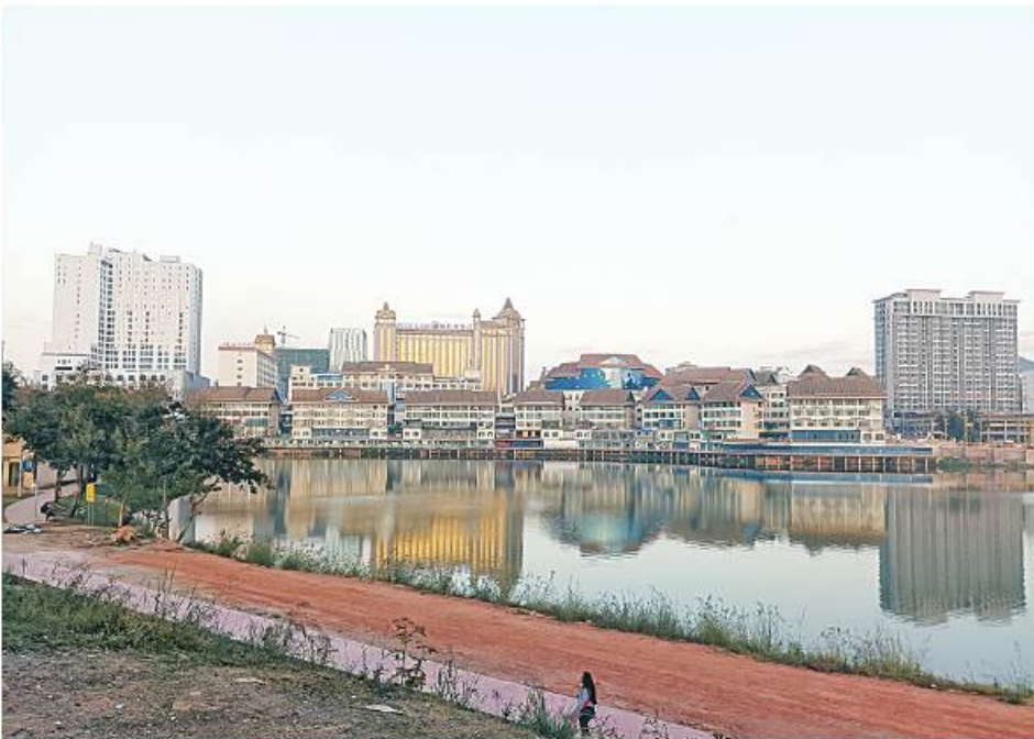
လောက်ကိုင်မြို့ရှိ တံချိန်ရေကန်ကို တွေ့ရစဉ်။

ဘုန်းတော်ကြီးကျောင်းရှိရာကို လောက်ကိုင်မြို့ တွင်းတစ်နေရာကနေ ဖြတ်သန်းမောင်းနှင်လာခဲ့ ပေမဲ့ မိမိတို့အဖွဲ့မရောက်ဖူး၊ မတွေ့မမြင်ဖူးသေးတဲ့ နေရာတွေဖြစ်ကြောင်း သတိထားလိုက်မိတယ်။ အချိန်က ညနေပိုင်းကိုရောက်ရှိလာပြီဖြစ်တဲ့အတွက် ကားတွေ၊ ဆိုင်ကယ်တွေ၊ လူတွေ ပိုမိုရှုပ်ထွေးလာတာ