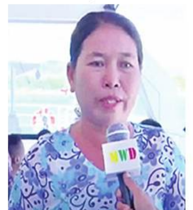
အထူးကုပါ... ရာဂါအထူး... ခေါင်း/လည်... မီးယပ်အထူး...