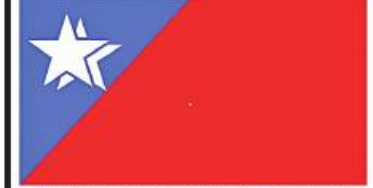
အမျိုးသားဒီမိုကရေစီအင်အားစုပါတီ (National Democratic Force Party (NDF))၏ တံဆိပ်ပုံစံ