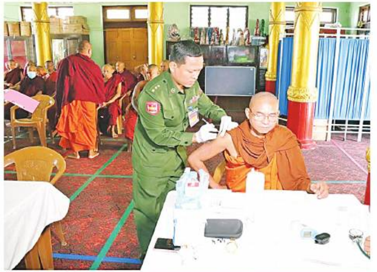
သံဃာတော်များကို မြောက်ပိုင်းတိုင်းစစ်ဌာနချုပ် နယ်မြေခံဆေးကုသရေးအဖွဲ့က ကျန်းမာရေးစောင့်ရှောက်မှုလုပ်ငန်းများ ဆောင်ရွက်ပေးစဉ်။