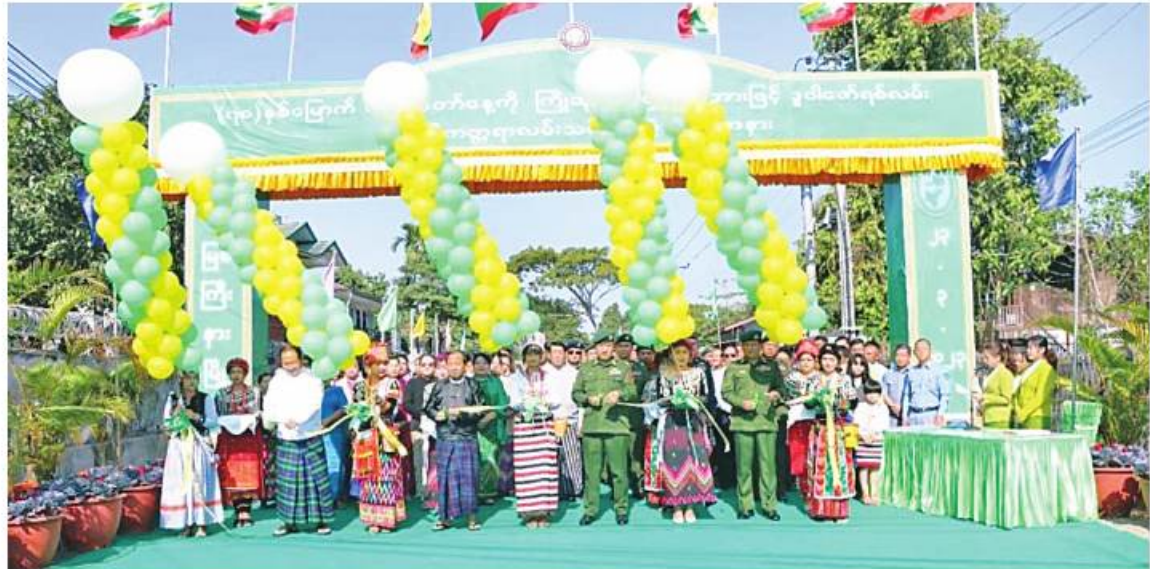
မြောက်ပိုင်းတိုင်းစစ်ဌာနချုပ် တိုင်းမှူး ဗိုလ်ချုပ်ကိုကိုမောင်နှင့် တာဝန်ရှိသူများက အဆင့်မြင့်နိုင်လွန်ကတ္တရာလမ်းသစ်ကို ဖဲကြီးဖြတ် ဖွင့်လှစ်ပေးစဉ်။