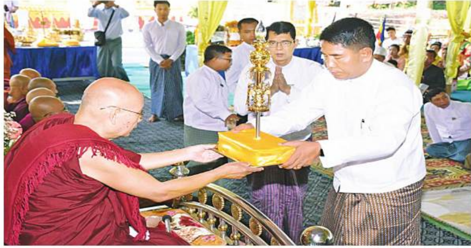
ဆရာတော်ထံ အနောက်တောင်တိုင်းစစ်ဌာနချုပ် တိုင်းမှူး ဗိုလ်မှူးချုပ်ကြည်ခိုင် စိန်ဖူးတော် ဆက်ကပ် လှူဒါန်းစဉ်။

ဆရာတော်ထံမှ အနုမောဒနာတရားနာကြားကာ ရေစက်သွန်းချအမျှပေးဝေကြသည်။ ယင်းနောက် တိုင်းမှူးနှင့် တက်ရောက်လာကြသူများက စိန်ဖူးတော်၊ ငှက်မြတ်နားတော်၊ ရွှေထီးတော်တို့ကို ဒေဝါဝင်းရာဇာဝင်းများခြံရံလျက် ပြည်လုံးကပ်ကျော်ကိုးနဝင်းစေတီတော်မြတ်အား လက်ယာရစ်လှည့်လည်ပူဇော်ကြ၍ မင်္ဂလာအချိန်တွင် စေတီအတွတ်သို့ပင့်ဆောင်တင်လှူပူဇော်ကြပြီး သံဃာတော်များက စေတီတော်မြတ်အား ဗုဒ္ဓါဘိသေက အနေကဇာတင်ပူဇော်ကြသည်။