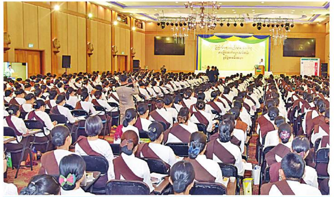
ဒုတိယဝန်ကြီးချုပ်နှင့် ပြည်ထဲရေးဝန်ကြီးဌာန ပြည်ထောင်စုဝန်ကြီး ဒုတိယဗိုလ်ချုပ်ကြီးစိုးထွဋ် အခြေခံအဘိဓမ္မာသင်တန်း ဖွင့်ပွဲအခမ်းအနားတွင် အမှာစကားပြောကြားစဉ်။

ခုနစ်ကျမ်းနှင့်ပတ်သက်၍ အခြေခံအဆင့် အနေဖြင့် သိရှိနားလည်နိုင်စေရန်နှင့် အမျိုး၊ ဘာသာ၊ သာသနာ၊ အမျိုးဂုဏ်တော်တို့ကို ချစ်မြတ်နိုးတတ်စေရန် စသည်ရည်ရွယ် ချက်များဖြင့် ဖွင့်လှစ်ခြင်းဖြစ်ကြောင်း၊ အဘိဓမ္မာတရား၏ အခြေခံကိုသိရှိနားလည် ပြီး လုပ်ငန်းများလုပ်ကိုင်ဆောင်ရွက်ခြင်း နှင့် ပေါင်းသင်းဆက်ဆံရာတွင်လည်း များစွာအထောက်အကူပြုခြင်း စသည် အကျိုးကျေးဇူးကို ရရှိမည်ဖြစ်ကြောင်း ပြောကြားပြီး ပြည်ထောင်စုဝန်ကြီးနှင့် ဇနီး၊ တာဝန်ရှိသူများက သင်တန်းတက် ရောက်ကြမည့် သင်တန်းသူများကို ရင်းရင်း နှီးနှီးနှုတ်ဆက်အားပေးသည်။ အဆိုပါ အခြေခံအဘိဓမ္မာသင်တန်းကို ပြည်ထဲရေးဝန်ကြီးဌာန ပြည်ထောင်စု ဝန်ကြီးရုံး၊ မြန်မာနိုင်ငံရဲတပ်ဖွဲ့၊ အထွေ ထွေအုပ်ချုပ်ရေးဦးစီးဌာန၊ အထူးစုံစမ်း စစ်ဆေးရေးဦးစီးဌာန၊ အကျဉ်းဦးစီးဌာနနှင့် မီးသတ်ဦးစီးဌာနတို့မှ တပ်ဖွဲ့ဝင်၊ ဝန်ထမ်း များ၊ အရာထမ်း(အမျိုးသမီး)၊ တပ်ဖွဲ့ဝင်၊ ဝန်ထမ်းအရာထမ်းများ၏ မိသားစုဝင် သင်တန်းသူစုစုပေါင်း ၆၄၃ ဦး တက် ရောက်ကြမည်ဖြစ်ပြီး သင်တန်းကာလမှာ မတ် ၂၃ ရက်မှ ၃၀ ရက်ထိ ဖွင့်လှစ် ပို့ချသွားမည်ဖြစ်ကြောင်း သိရသည်။