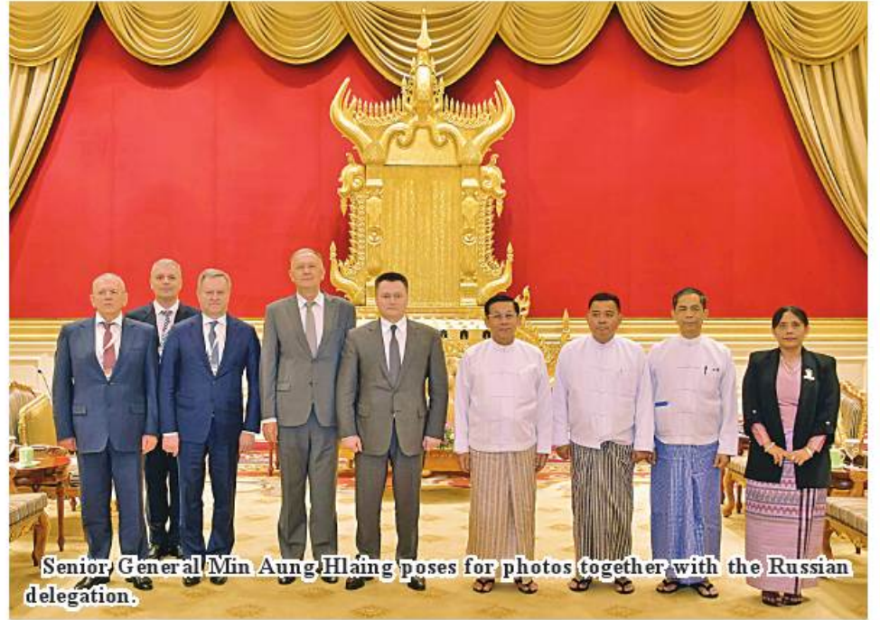
Senior General Min Aung Hlaing poses for photos together with the Russian delegation.