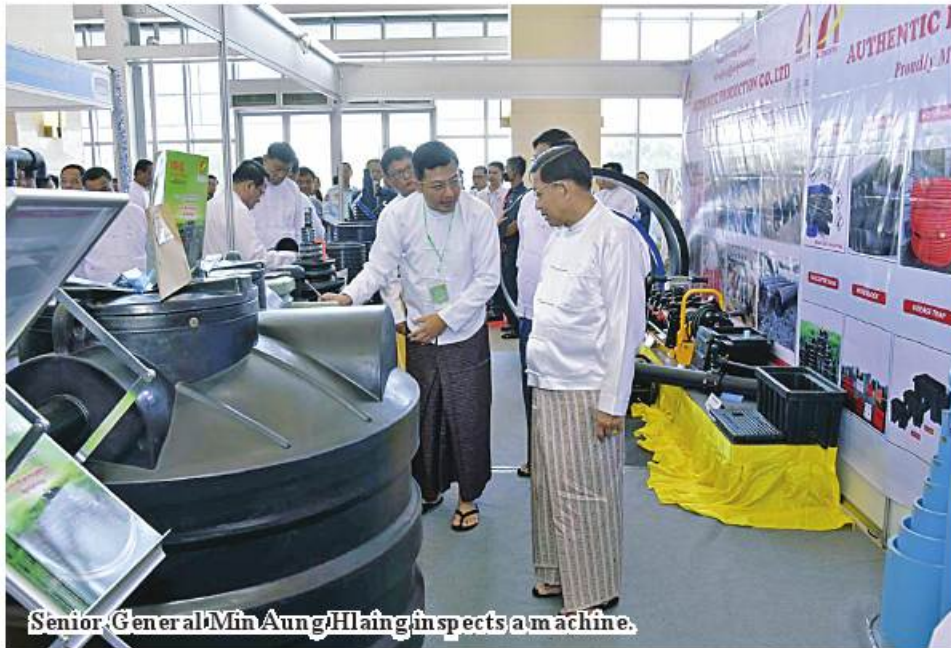
Senior General Min Aung Hlaing inspects a machine.

development of the water sector by related ministries and organizations under the leadership of the government in accordance with the theme of World Water Day (2023), accelerating change to solve the water & sanitation issue, it is important to cooperate with friendly countries and local and international non-governmental organizations, to take measures to supply