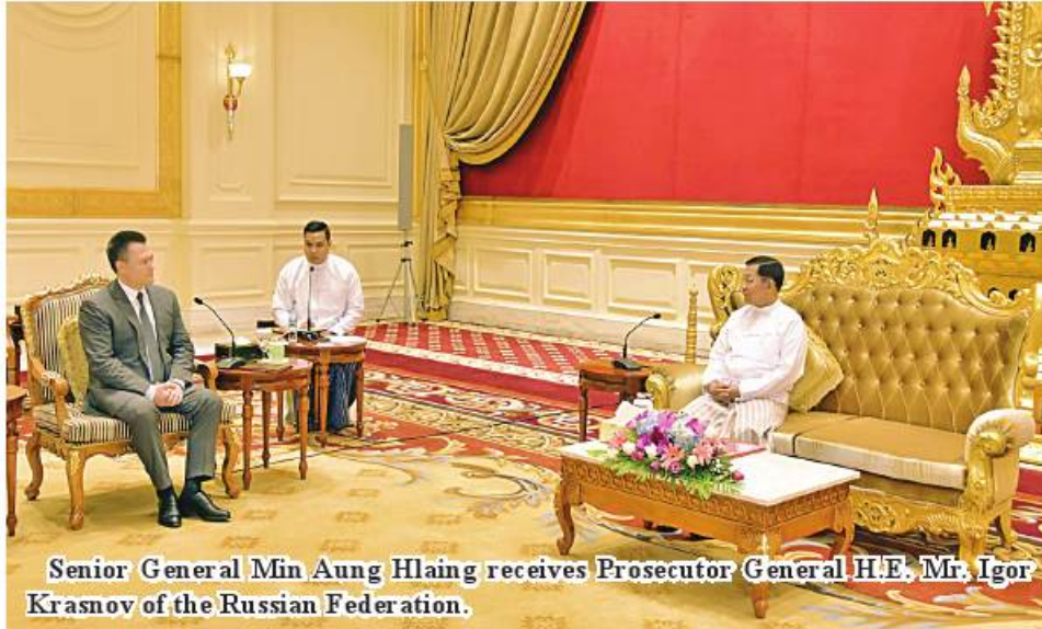
Senior General Min Aung Hlaing receives Prosecutor General H.E. Mr. Igor Krasnov of the Russian Federation.

Nay Pyi Taw March 22 Chairman of the State Administration Council Prime Minister Senior General Min Aung Hlaing received a delegation led by Prosecutor General H.E. Mr. Igor Krasnov of Russian Federation at the parlour of the Credentials Hall of the Office of the SAC Chair-