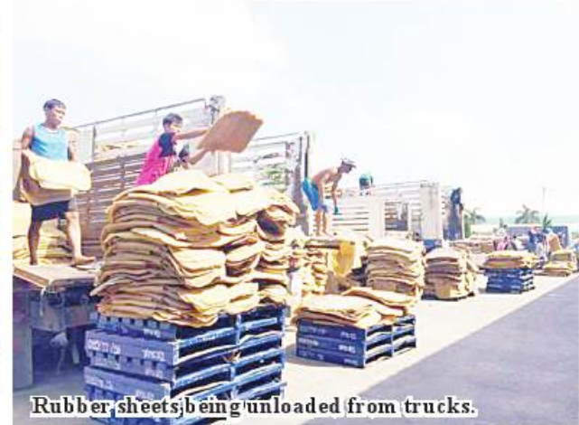
Rubber sheets being unloaded from trucks.

K1,400 per pound of rubber. A plan was set to export some 300,000 tons of rubber in 2023. 336