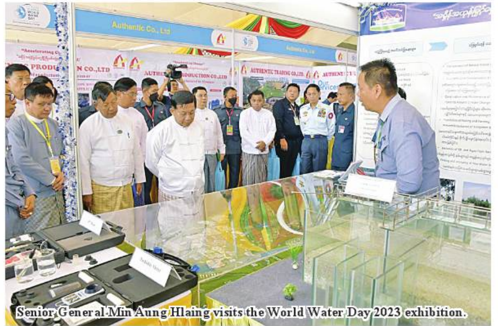
Senior General Min Aung Hlaing visits the World Water Day 2023 exhibition.

The ceremony was organized with the three ob-