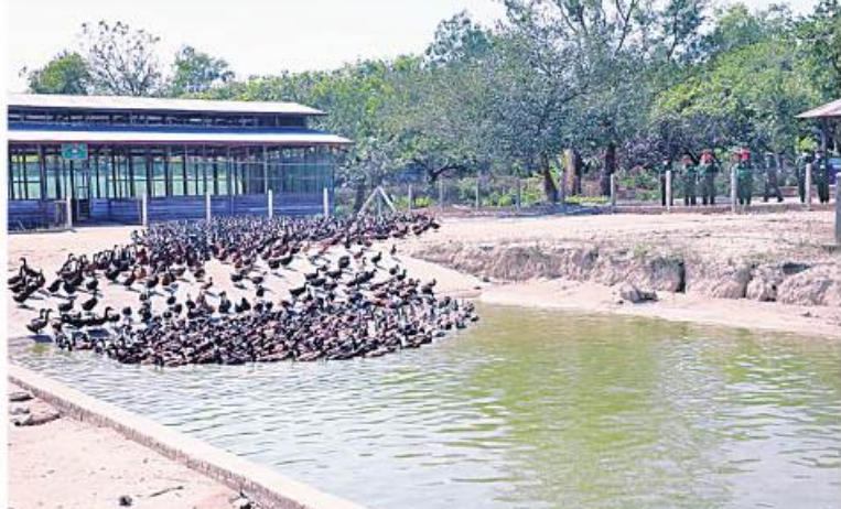
ကမ်းရိုးတန်းဒေသတိုင်းစစ်ဌာနချုပ် တိုင်းမှူး ဗိုလ်ချုပ်စောသန်းလှိုင် ထားဝယ်တပ်နယ်အတွင်း ဥစားဘဲနှင့် ဥစားကြက် မွေးမြူရေးလုပ်ငန်းများကို ကြည့်ရှုစစ်ဆေးစဉ်။

နေပြည်တော် မတ် ၂၂ ကိုဝစ်-၀၉ ရောဂါ ဖြစ်ပွားမှုကြောင့် ရောဂါကာကွယ်၊ ထိန်းချုပ်၊ ကုသရေး