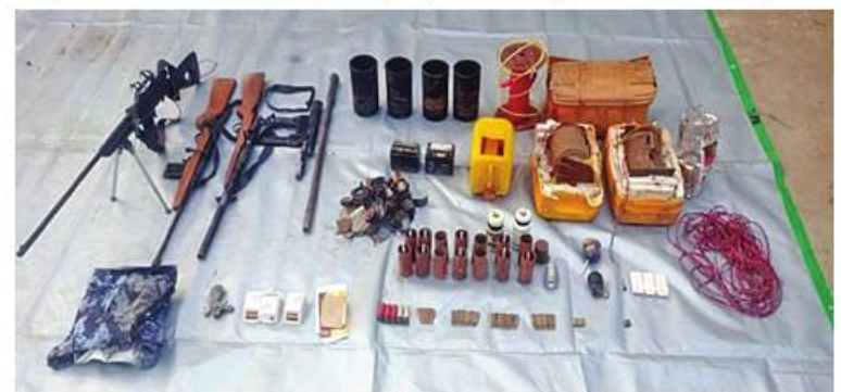
၂၀၂၃ ခုနှစ် မတ် ၁၅ ရက်တွင် မုံရွာမြို့ အေးသာယာရပ်ကွက် ချင်းတွင်းမြစ်ကမ်း အနီး၌ တရားခံများနှင့်အတူ သိမ်းဆည်းရမိခဲ့သည့် လက်နက်၊ ခဲယမ်း၊ မိုင်းနှင့် ဆက်စပ်ပစ္စည်းများ မှတ်တမ်းဓာတ်ပုံ။