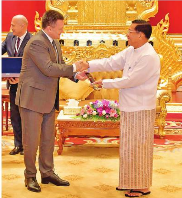
နိုင်ငံတော်စီမံအုပ်ချုပ်ရေးကောင်စီဥက္ကဋ္ဌ နိုင်ငံတော်ဝန်ကြီးချုပ် ဗိုလ်ချုပ်မှူးကြီးမင်းအောင်လှိုင်နှင့် ရုရှားဖက်ဒရေးရှင်းနိုင်ငံ ရှေ့နေချုပ် H.E. Mr. Igor Krasnov တို့ အမှတ်တရလက်ဆောင်ပစ္စည်းများ အပြန်အလှန်ပေးအပ်စဉ်။