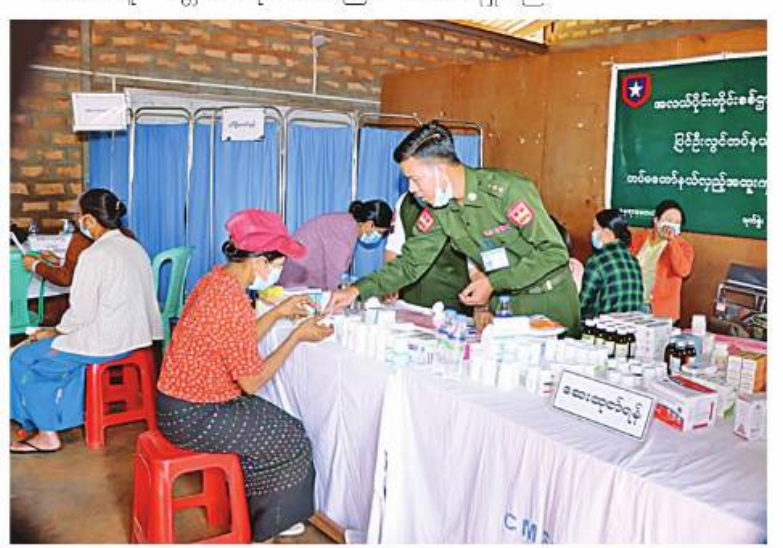
အလယ်ပိုင်းတိုင်းစစ်ဌာနချုပ် နယ်မြေခံဆေးကုသရေးအဖွဲ့က ပြင်ဦးလွင်မြို့နယ်အတွင်းရှိ ဒေသခံပြည်သူများကို ကျန်းမာရေးစောင့်ရှောက်မှုလုပ်ငန်းများ ဆောင်ရွက်ပေးစဉ်။