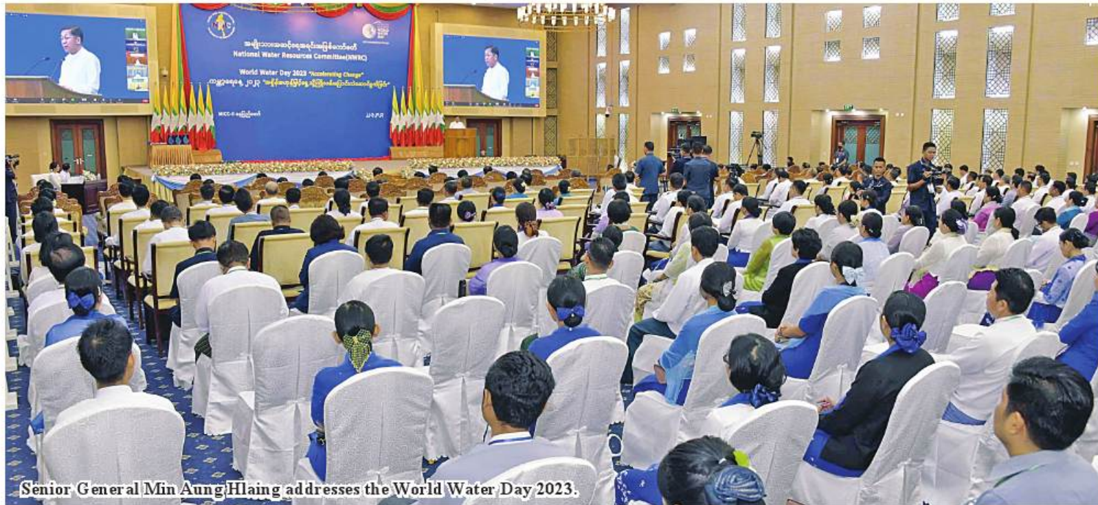
Senior General Min Aung Hlaing addresses the World Water Day 2023.

Nay Pyi Taw March 22 World Water Day 2023 was observed at Myanmar International Convention Centre II here this morning, addressed by Chairman of National Water Resources Committee (NWRC) Chairman of State Administration Council Prime Minister Senior General Min Aung Hlaing.