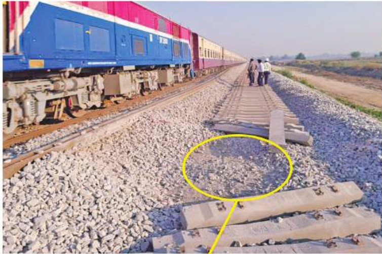
မိုင်းပေါက်ကွဲ၍ ကွန်ကရစ်လီမားတုံးသစ်များ ထိခိုက်ပျက်စီးမှု

မတ် ၂၂ ရက်က အကြမ်းဖက်သောင်းကျန်းသူများ၏ ရက်စက်ကြမ်းကြုတ်စွာမိုင်းခွဲတိုက်ခိုက်မှုကြောင့် စီမံကိန်းဆောင်ရွက်နေသည့်ရထားလမ်းထိခိုက်ပျက်စီးမှုအခြေအနေ။