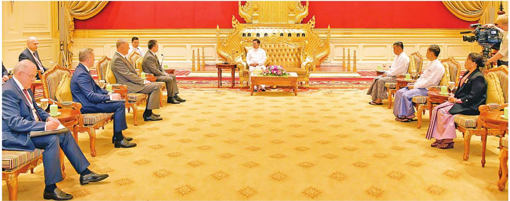
နိုင်ငံတော်စီမံအုပ်ချုပ်ရေးကောင်စီဥက္ကဋ္ဌ နိုင်ငံတော်ဝန်ကြီးချုပ် ဗိုလ်ချုပ်မှူးကြီးမင်းအောင်လှိုင် ရုရှားပက်ဒရေးရှင်းနိုင်ငံ ရှေ့နေချုပ် H.E. Mr. Igor Krasnov ဦးဆောင်သည့် ကိုယ်စားလှယ်အဖွဲ့ကို လက်ခံတွေ့ဆုံစဉ်။

နေပြည်တော် မတ် ၂၂ မင်းအောင်လှိုင် ရုရှားပက်ဒရေးရှင်းနိုင်ငံ ရှေ့နေ နေပြည်တော်ရှိ နိုင်ငံတော်စီမံအုပ်ချုပ်ရေးကောင်စီ ထိုသို့တွေ့ဆုံစဉ် မြန်မာနိုင်ငံနှင့် ရုရှားနိုင်ငံ နိုင်ငံတော်စီမံအုပ်ချုပ်ရေးကောင်စီ ဥက္ကဋ္ဌ နိုင်ငံတော်ဝန်ကြီးချုပ် H.E. Mr. Igor Krasnov ဦးဆောင်သည့် ဥက္ကဋ္ဌရုံး သံတမန်ဆောင်ရွက်ရေးနှင့် လက်ခံ တို့အကြား သံတမန်ဆက်ဆံရေးဆိုင်ရာ နိုင်ငံတော်ဝန်ကြီးချုပ် ဗိုလ်ချုပ်မှူးကြီး ကိုယ်စားလှယ်အဖွဲ့ကို ယနေ့မနန်းလွဲပိုင်းတွင် တွေ့ဆုံသည်။ စာမျက်နှာ ၁၈ ကော်လံ ၁ ☆