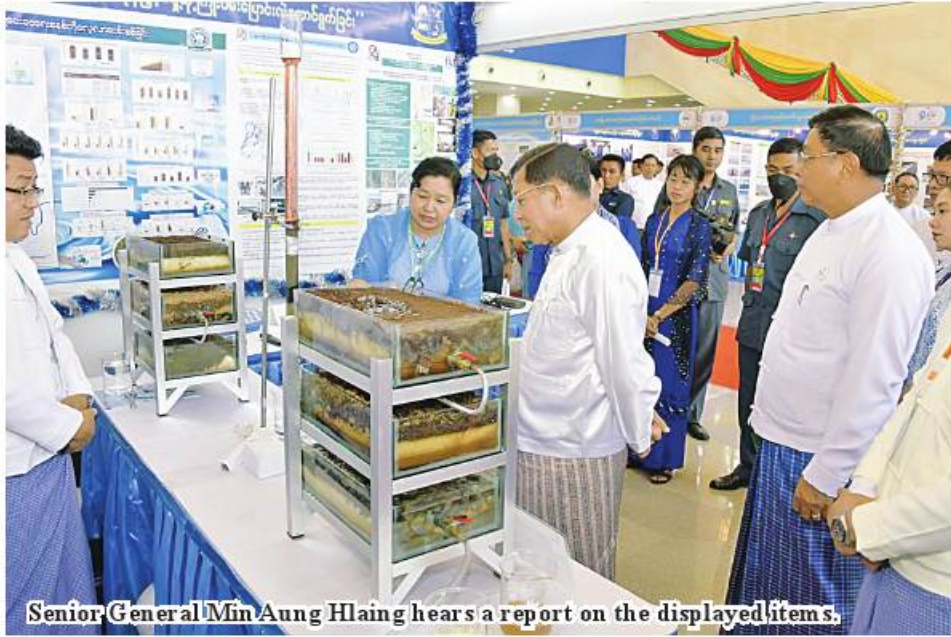
Senior General Min Aung Hlaing hears a report on the displayed items.