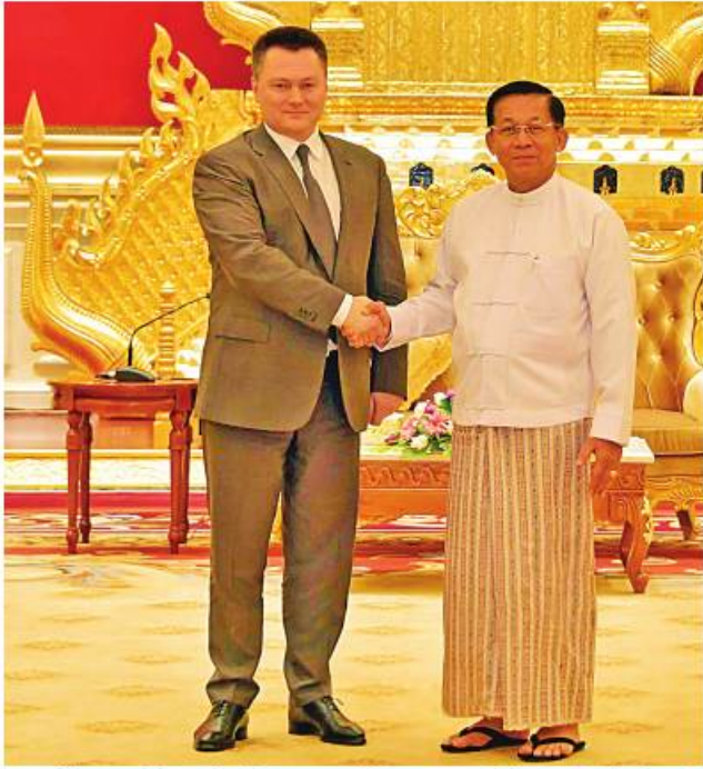
နိုင်ငံတော်စီမံအုပ်ချုပ်ရေးကောင်စီဥက္ကဋ္ဌ နိုင်ငံတော်ဝန်ကြီးချုပ် ဗိုလ်ချုပ်မှူးကြီးမင်းအောင်လှိုင်နှင့် ရုရှားဖက်ဒရေးရှင်းနိုင်ငံ ရှေ့နေချုပ် H.E. Mr. Igor Krasnov တို့ ရင်းရင်းနှီးနှီးနှုတ်ဆက်စဉ်။