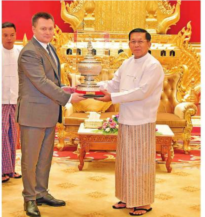
နိုင်ငံတော်စီမံအုပ်ချုပ်ရေးကောင်စီဥက္ကဋ္ဌ နိုင်ငံတော်ဝန်ကြီးချုပ် ဗိုလ်ချုပ်မှူးကြီးမင်းအောင်လှိုင်နှင့် ရုရှားဖက်ဒရေးရှင်းနိုင်ငံ ရှေ့နေချုပ် H.E. Mr. Igor Krasnov တို့ အမှတ်တရလက်ဆောင်ပစ္စည်းများ အပြန်အလှန်ပေးအပ်စဉ်။

ကျော့မှူးမှအဆက် တိုးတက်ကောင်းမွန်မှု အခြေအနေများ၊ ဥပဒေရေးရာကိစ္စရပ်များတွင် ပူးပေါင်း ဆောင်ရွက်မှုများ တိုးမြှင့်ဆောင်ရွက်သွား မည်အခြေအနေများ၊ မြန်မာနိုင်ငံမှ ဥပဒေ ပညာရှင်များ ရှာဖွေနိုင်စေရန် ဥပဒေပညာရပ် များ သင်ကြားပေးမည့်အခြေအနေများနှင့် ရုရှားနိုင်ငံမှ ဥပဒေရေးရာကျွမ်းကျင်သူ များက မြန်မာနိုင်ငံတွင် ဥပဒေနှင့်ပတ်သက်