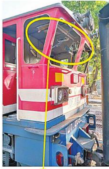
စက်ခေါင်းလေကာမှန်များကွဲကျနေပုံ