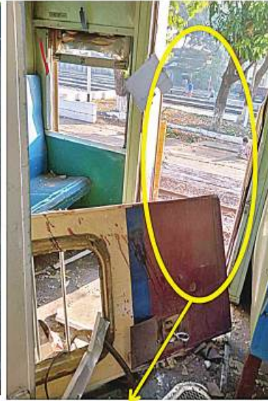
လူစီးတဲ့ တက်/ဆင်းပေါက်တံခါး ပြုတ်ကျ ပျက်စီးမှု အခြေအနေ