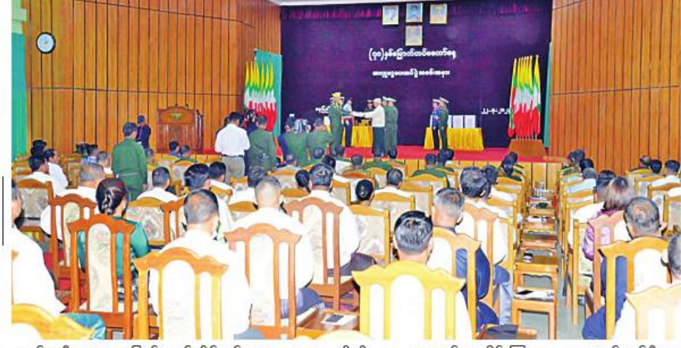
(၇၈)နှစ်မြောက် တပ်မတော်နေ့ကို ဂုဏ်ပြုကြိုဆိုသော အားဖြင့် စေတနာရှင် အလှူရှင်များက အလှူငွေများ ပေးအပ်လှူဒါန်းစဉ်။

နေပြည်တော် မတ် ၂၂ (၇၈)နှစ်မြောက် တပ်မတော်နေ့ကို ဂုဏ်ပြုကြိုဆိုသောအားဖြင့် စေတနာရှင် အလှူရှင်များက အလှူငွေများ ပေးအပ်လှူဒါန်းပွဲကို ယနေ့မနက် ၉ နာရီခွဲတွင် နေပြည်တော် စစ်ကြောင်းရေးရာဌာန ဝန်ကြီးဌာန အစိုးရအဖွဲ့အစည်း အစည်းအဝေးခန်းမ၌ ဆင်ဖြူရှင်ခန်းမ၌ ကျင်းပ