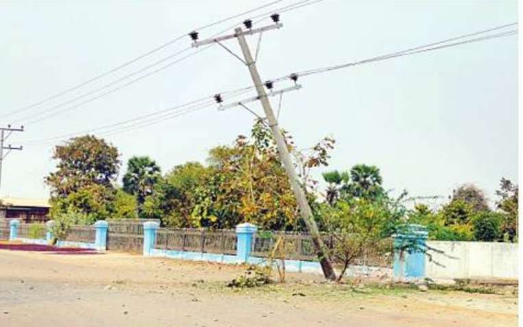
၂၀၂၃ ခုနှစ် မတ် ၁၂ ရက်တွင် မုံရွာမြို့ ရွှေရုံးရပ်ကွက် အင်းစပ်လမ်းတွင် အကြမ်းဖက်သူများက လက်လုပ်မိုင်းဖြင့် ဖောက်ခွဲခဲ့သည့် မှတ်တမ်းဓာတ်ပုံ။