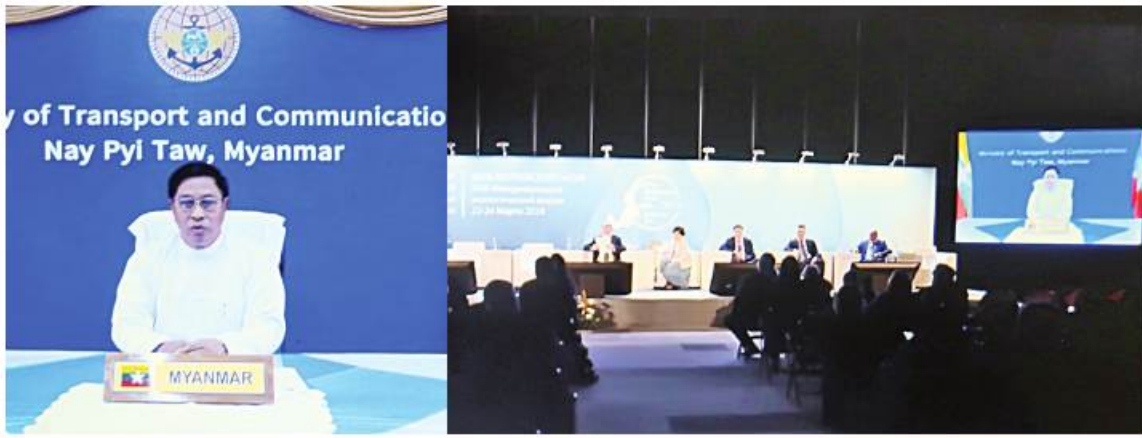
ဒုတိယဝန်ကြီးချုပ်နှင့် ပြည်ထောင်စုဝန်ကြီး ဝိုင်းချုပ်ကြီးတင်အောင်စန်း (၂၃)ကြိမ်မြောက် အပြည်ပြည်ဆိုင်ရာသဘာဝပတ်ဝန်းကျင်ဖိုရမ်သို့ တက်ရောက်အမှာစကားပြောကြားစဉ်။

နေပြည်တော် မတ် ၂၂ ရုရှားဖက်ဒရေရှင်းနိုင်ငံ စိန့်ပီတာစဘတ်အစိုးရအဖွဲ့၏ ဖိတ်ကြားချက်အရ စိန့်ပီတာစဘတ်မြို့၌ (၂၃)ကြိမ်မြောက် အပြည်ပြည်ဆိုင်ရာသဘာဝပတ်ဝန်းကျင် ဖိုရမ်နှင့်အတူ ပူးတွဲကျင်းပသည့် "Baltic Sea Day" သို့ ဒုတိယဝန်ကြီးချုပ်နှင့် ပို့ဆောင်ရေးနှင့် ဆက်သွယ်ရေးဝန်ကြီး ဌာန ပြည်ထောင်စုဝန်ကြီး ဝိုင်းချုပ်ကြီး တင်အောင်စန်းသည် ယနေ့မနက်လွှဲပိုင်းက နေပြည်တော် ပို့ဆောင်ရေးနှင့်ဆက်သွယ် ရေးဝန်ကြီးဌာနမှ online ဖြင့် တက် ရောက်သည်။ ဖိုရမ်ဖွင့်ပွဲ အခမ်းအနားတွင် ဒုတိယဝန်ကြီးချုပ်နှင့် ပြည်ထောင်စုဝန်ကြီး က လူသားများအတွက် ပင်လယ်သမုဒ္ဒရာ၏ အရေးပါမှု၊ အန္တရာယ်ရေပြင်အသုံးပြုသူများ အတွက် ဟန့်ချက်ညီသောအစီအမံများ ချမှတ်ရန်လိုအပ်မှု၊ သဘာဝပတ်ဝန်းကျင် ထိန်းသိမ်းရေး၊ ရေထုညစ်ညမ်းမှုကာကွယ် တားဆီးရေးနှင့်သက်ဆိုင်သည့် အပြည်ပြည်