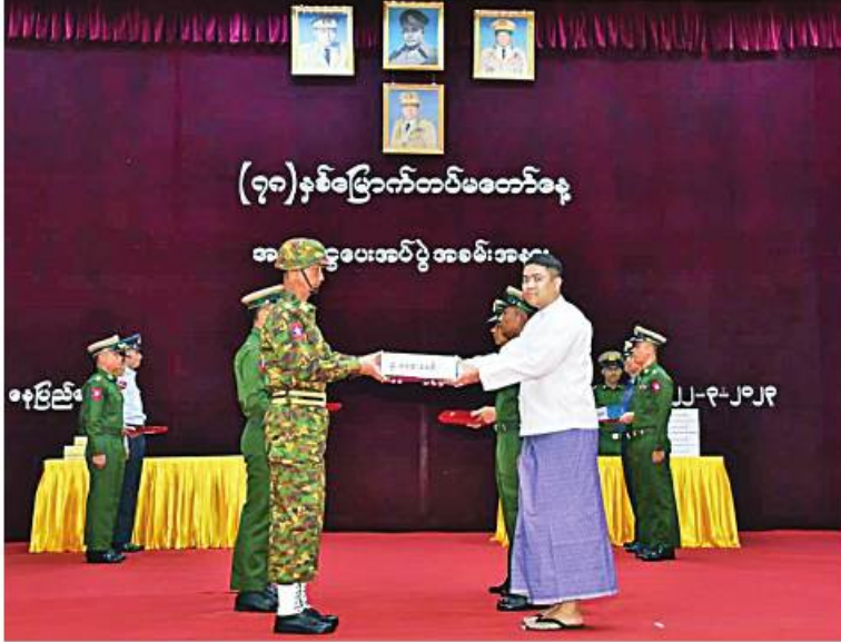
(၇၈)နှစ်မြောက်တပ်မတော်နေ့ကို ဂုဏ်ပြုကြိုဆိုသောအားဖြင့် စေတနာရှင် အလှူရှင်များက အလှူငွေများ ပေးအပ်လှူဒါန်းစဉ်။

နေပြည်တော် မတ် ၂၂ (၇၈)နှစ်မြောက် တပ်မတော်နေ့ကို ဂုဏ်ပြုကြိုဆိုသောအားဖြင့် စေတနာရှင် အလှူရှင်များက အလှူငွေများ ပေးအပ်လှူဒါန်းပွဲကို ယနေ့မနက် ၉ နာရီခွဲတွင် နေပြည်တော် စစ်ကြောင်းရေးရာဌာန ဝန်ကြီးဌာန အစိုးရအဖွဲ့အစည်း အစည်းအဝေးခန်းမ၌ ဆင်ဖြူရှင်ခန်းမ၌ ကျင်းပ