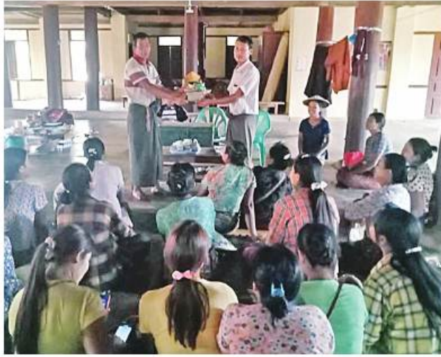
မိုးညှင်း မတ် ၂၁ အကောင်အထည်ဖော်ဆောင်ရွက်ခဲ့ ကချင်ပြည်နယ် မိုးညှင်းခရိုင် သည် လော့ဆွန်+မှန်ကင်းကျေးရွာ မိုးညှင်းမြို့နယ် ကျေးလက်ဒေသ ၌ မြစ်မီးရောင်ကျေးရွာစီမံကိန်း ဖွံ့ဖြိုးတိုးတက်ရေး ဦးစီးဌာနက အရင်းမပျောက်လည်ပတ်ရန်ပုံငွေ ၂၀၁၅-၂၀၁၆ ဘဏ္ဍာနှစ်က စတင် အဋ္ဌမအကြိမ် ထုတ်ချေးခြင်းကို