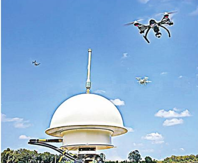
ယူကရိန်းကို တန်ပြန်ဒရုန်း (Counter Drone)စနစ်ရောင်းချမှုအတွက် အစွဲရောင်းခွင့်ပြုပေးခဲ့ကြောင်း မတ် ၂၀ ရက်က The Defense Post

တွင် ရေးသားဖော်ပြထားသည်။ ယူကရိန်း-ရုရှားပဋိပက္ခအပေါ် ၎င်း၏ မူဝါဒကို ပြန်လည်သုံးသပ်နေစဉ် ဖေဖော်ဝါရီလလယ်တွင် အစွဲရောင်းနိုင်ငံက ပိုကုန်လိုင်စင်ကို သဘောတူခွင့်ပြုပေးခဲ့ကြောင်း သတင်းရင်းမြစ်များကို ကိုးကား၍ Axios သတင်းဌာနက ဖော်ပြခဲ့သည်။ ရုရှားတပ်ဖွဲ့များကို တုံ့ပြန်တိုက်ခိုက်ရန် ပဋိပက္ခအတွင်း ယူကရိန်းသို့လက်နက်ရောင်းချနိုင်ရေးအတွက် အစွဲရောင်းနိုင်ငံက ကာကွယ်ရေးတင်ပို့ခွင့်လိုင်စင်ကို ပထမဆုံး အကြိမ် ခွင့်ပြုလိုက်ခြင်းလည်းဖြစ်ကြောင်း သိရသည်။ အစွဲရောင်းနိုင်ငံခြားရေးဝန်ကြီး Eli Cohen က ယူကရိန်းသမ္မတ ဝီလန်စကီးထံ ဖေဖော်ဝါရီ ၁၅ ရက်က ကိုယ်စိမ်းဖြူတော်သို့ သွားရောက်လည်ပတ်စဉ် အတည်ပြုချက်ပေးခဲ့သည်။ အစွဲရောင်းကာကွယ်ရေးထုတ်လုပ်သူ