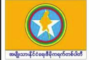
အမျိုးသားနိုင်ငံရေးဒီမိုကရက်တစ်ပါတီ