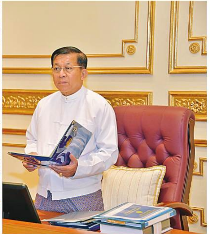
အမျိုးသားစီမံကိန်းကော်မရှင်ဥက္ကဋ္ဌ နိုင်ငံတော်စီမံအုပ်ချုပ်ရေးကောင်စီဥက္ကဋ္ဌ နိုင်ငံတော်ဝန်ကြီးချုပ် ဗိုလ်ချုပ်မှူးကြီးမင်းအောင်လှိုင် အမျိုးသားစီမံကိန်းကော်မရှင်(၁/၂၀၂၃)အစည်းအဝေးတွင် အမှာစကားပြောကြားစဉ်။

နေပြည်တော် မတ် ၂၁ အမျိုးသားစီမံကိန်းကော်မရှင် (၁/၂၀၂၃) အစည်းအဝေးကို ယနေ့နံနက်ပိုင်းတွင် နေပြည်တော်ရှိ နိုင်ငံတော်စီမံအုပ်ချုပ်ရေးကောင်စီဥက္ကဋ္ဌ ရုံး အစည်းအဝေးခန်းမ၌ ကျင်းပရာ အမျိုးသားစီမံကိန်းကော်မရှင်ဥက္ကဋ္ဌ နိုင်ငံတော်စီမံအုပ်ချုပ်ရေးကောင်စီဥက္ကဋ္ဌ နိုင်ငံတော်ဝန်ကြီးချုပ် ဗိုလ်ချုပ်မှူးကြီးမင်းအောင်လှိုင် တက်ရောက်အမှာစကားပြောကြားသည်။ အစည်းအဝေးသို့ အမျိုးသားစီမံကိန်းကော်မရှင်ဒုတိယဥက္ကဋ္ဌ နိုင်ငံတော်စီမံအုပ်ချုပ်ရေးကောင်စီဒုတိယဥက္ကဋ္ဌ ဒုတိယဝန်ကြီးချုပ် ဒုတိယဗိုလ်ချုပ်မှူးကြီးစိုးဝင်း၊ အမျိုးသားစီမံကိန်းကော်မရှင်အဖွဲ့ဝင် ပြည်ထောင်စုဝန်ကြီးများ၊ ပြည်ထောင်စုစာရင်းစစ်ချုပ်၊ ပြည်ထောင်စုရာထူးဝန်အဖွဲ့ဥက္ကဋ္ဌ၊ မြန်မာနိုင်ငံတော်ဗဟိုဘဏ်ဥက္ကဋ္ဌ၊ နေပြည်တော်ကောင်စီဥက္ကဋ္ဌနှင့် ဒုတိယဝန်ကြီးများ တက်ရောက်ကြပြီး တိုင်းဒေသကြီးနှင့် ပြည်နယ်ဝန်ကြီးချုပ်များ၊ စာမျက်နှာ ၁၆ ကော်လံ ၁ B