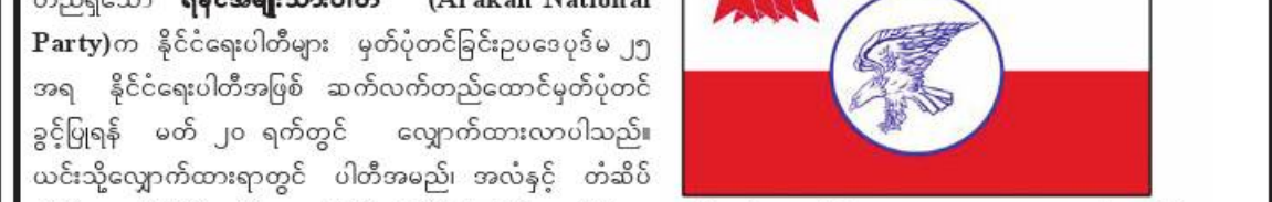
ရခိုင်အမျိုးသားပါတီ (Arakan National Party)၏ တံဆိပ်ပုံစံ