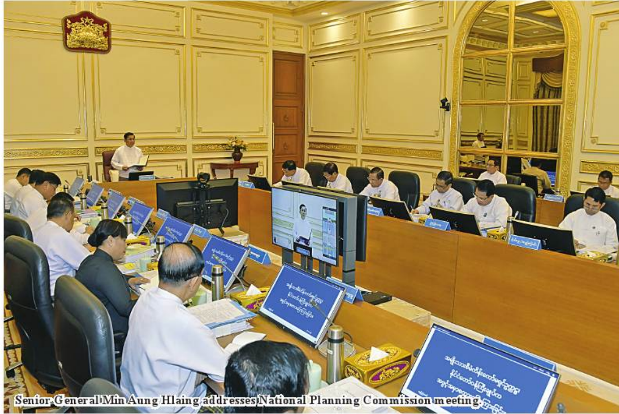
Senior General Min Aung Hlaing addresses National Planning Commission meeting