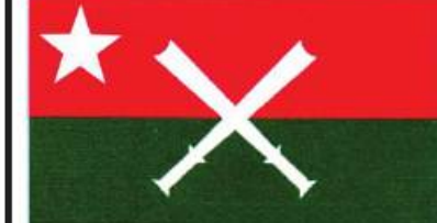
ကချင်အမျိုးသားကွန်ဂရက်ပါတီ [Kachin National Congress (KNC)]၏ တံဆိပ်ပုံစံ