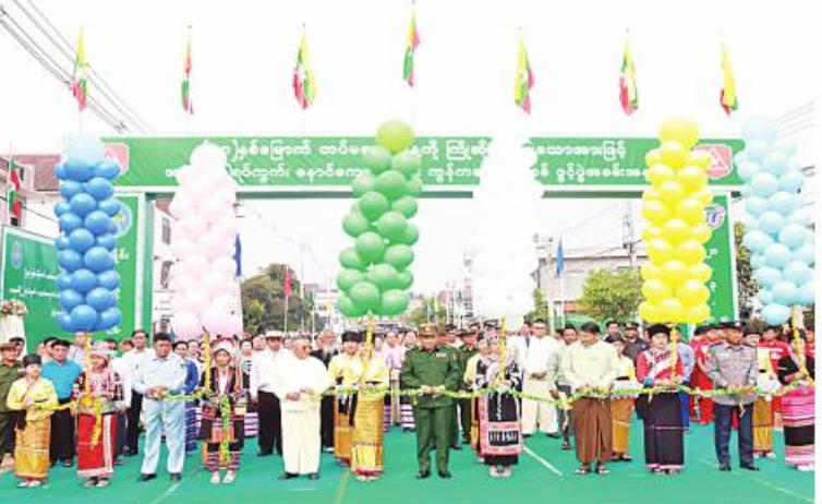
ကြိုဒေသတိုင်းစစ်ဌာနချုပ် တိုင်းမှူး ဗိုလ်ချုပ်နီလင်းအောင်နှင့် တာဝန်ရှိသူများက ကွန်ကရစ်လမ်းသစ်ကို ဖဲကြိုးဖြတ်ဖွင့်လှစ်ပေးစဉ်။

နေပြည်တော် မတ် ၂၁ (၇၈)နှစ်မြောက် တပ်မတော်နေ့ကို ကြိုဆိုဂုဏ်ပြုသောအားဖြင့် ရှမ်းပြည်နယ် (အရှေ့ပိုင်း) ကျိုင်းတုံမြို့ အမှတ်(၂) ရပ်ကွက် နောင်ကျောက်လမ်း ကွန်ကရစ်လမ်းသစ်ဖွင့်ပွဲကို ယနေ့နံနက်ပိုင်းတွင် ပြုလုပ်ရာ ကြိုဒေသတိုင်းစစ်ဌာနချုပ် တိုင်းမှူး ဗိုလ်ချုပ်နီလင်းအောင်နှင့် အဖွဲ့ဝင်များ၊ ပြည်နယ်၊ ခရိုင်၊ မြို့နယ် အဆင့် ဌာနဆိုင်ရာတာဝန်ရှိသူများ၊ မြို့မိမြို့ဖများ၊ လူမှုရေးအသင်းအဖွဲ့များ၊ တိုင်းရင်းသားစာပေနှင့် ယဉ်ကျေးမှုအဖွဲ့များနှင့် ဖိတ်ကြားထားသူများ တက်ရောက်ကြသည်။ ဦးစွာ တိုင်းမှူးက အမှာစကားပြောကြားသည်။ ထို့နောက် နောင်ကျောက်လမ်း ကွန်ကရစ်လမ်းသစ်ဖွင့်ပွဲကို နောင်ကျောက်လမ်း ကွန်ကရစ်လမ်းသစ်ဖွင့်ပွဲ ဖြစ်ပွားမှုအခြေအနေ