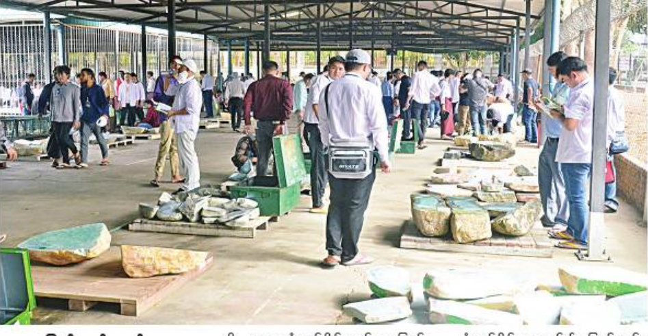
နေပြည်တော် မတ် ၂၁ (၅၈)ကြိမ်မြောက် မြန်မာ့ကျောက်မျက်ရတနာပြပွဲ ပဉ္စမနေ့တွင် ကျောက်မျက်ရတနာပြပွဲ ပဉ္စမနေ့ ခန်းမ၌ ဆက်လက်ကျင်းပသည်။

အတွင်း ခင်းကျင်းပြသထား သည့် ကျောက်စိမ်းအတွဲများနှင့် ခန်းမအပြင်ဘက် သတ်မှတ်နေရာ များအလိုက် ခင်းကျင်းပြသထား သည့် ကျောက်စိမ်းအတွဲများ ကို စိတ်ကြိုက်လေ့လာကြည့်ရှု ကြသည်။ ယနေ့ပြပွဲတွင် ကျောက်စိမ်း အတွဲ ၂၅၀ အနက် ကျောက်စိမ်း အတွဲ အမှတ်(၁)မှ (၇၅၀) ထိကို ပြည်တွင်းပြည်ပ ရတနာကုန်သည် များကို အိတ်ဖွင့်တင်ဒါစနစ် ဖြင့် ရောင်းချပေးခဲ့ရာ ကျောက်စိမ်း အတွဲ ၅၇၆ တွဲ ရောင်းချနိုင်ခဲ့ ကြောင်း ကြေညာသည်။ ကျောက်စိမ်းအတွဲအမှတ် (၇၅၀)မှ (၁၅၀၀) ထိကို ပြည်တွင်း၊ ပြည်ပ ရတနာကုန်သည်များက ကြည့်ရှု စစ်ဆေးကြပြီး ဈေးနှုန်းတင်သွင်း လွှာများကို တင်ဒါပေးအတွင်း သို့ ထည့်သွင်းကြသည်။ ကျောက်စိမ်း အတွဲအမှတ် (၇၅၀) မှ (၁၅၀၀) ထိ တင်သွင်း ထားသည့် ဈေးနှုန်းတင်သွင်းလွှာ များကို တာဝန်ရှိသူများက ညနေ ၃ နာရီတွင်ပိတ်သိမ်းပြီး တင်ဒါပေး မှုများကို ဖွင့်ဖောက်စစ်ဆေးကာ မတ် ၂၂ ရက် နံနက် ၈ နာရီတွင် ရောင်းချရသည့် ကျောက်စိမ်းအတွဲ များအား ကြေညာသွားမည်ဖြစ် ကြောင်း သိရသည်။ ပြပွဲတွင် ပြည်တွင်း၊ ပြည်ပ ရတနာကုန်သည်များကို အိတ်ဖွင့် တင်ဒါစနစ်ဖြင့် ပုလဲအတွဲ ၂၉၇ တွဲ ကို မတ် ၁၈ ရက်မှ ၁၉ ရက်ထိ ရောင်းချပေးခဲ့ရာ ပုလဲအတွဲ ၂၉၀ ကိုလည်းကောင်း၊ ကျောက်မျက် အတွဲ ၁၂၀ ကို မတ် ၂၀ ရက်တွင် ရောင်းချပေးခဲ့ရာ ကျောက်မျက် အတွဲ ၇၇ တွဲ ကိုလည်းကောင်း ရောင်းချပေးနိုင်ခဲ့သည်။ ထို့ပြင် မဏိရတနာကျောက်စိမ်း ခန်းမအတွင်း၌ ကျောက်မျက် နှင့် လက်ဝတ်ရတနာအရောင်း ဆိုင်များကိုလည်း ဖွင့်လှစ် ထားရှိရာ လာရောက်လေ့လာ ဝယ်ယူသူများဖြင့် စည်ကားလျက် ရှိကြောင်း သိရသည်။ (သတင်းစဉ်)