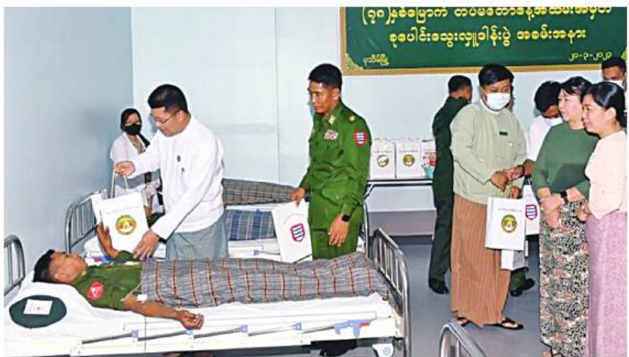
ဧရာဝတီတိုင်းဒေသကြီး ဝန်ကြီးချုပ် ဦးတင်မောင်ဝင်း သွေးလှူရင်များကို ကြည့်ရှုအားပေးပြီး အာဟာရဖြည့်စားသောက်ဖွယ်ရာ များနှင့် အားဆေးများ ပေးအပ်စဉ်။

နေပြည်တော် မတ် ၂၁ ၂၀၂၃ ခုနှစ် မတ် ၂၇ ရက်တွင် ကျရောက်မည့် (၇၈)နှစ်မြောက်တပ်မတော်နေ့ကို ကြိုဆိုဂုဏ်ပြုသောအားဖြင့် ယနေ့နံနက်ပိုင်းတွင် ဧရာဝတီတိုင်းဒေသကြီး ပုသိမ်မြို့ရှိ ပြည်သူ့ဆေးရုံကြီး၌ အနောက်တောင်တိုင်းစစ်ဌာနချုပ် ကွပ်ကဲမှုအောက် တပ်ရင်း၊ တပ်ဖွဲ့များမှ အရာရှိ၊ စစ်သည်၊ မိသားစုဝင်များ၊ မြန်မာနိုင်ငံရဲတပ်ဖွဲ့ဝင်များနှင့် ဌာနဆိုင်ရာဝန်ထမ်းများက သွေးပေါင်ချိန်စစ်ဆေးခြင်းနှင့် လိုအပ်သည့် စစ်ဆေးမှုများခံယူကြပြီး သတ်မှတ်နေရာအသီးသီး၌ စုပေါင်းသွေးလှူဒါန်း