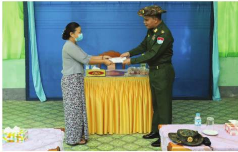
ကမ်းရိုးတန်းဒေသတိုင်းစစ်ဌာနချုပ် တိုင်းမှူး ဗိုလ်ချုပ်စောသန်းလှိုင် မြန်မာနိုင်ငံရဲတပ်ဖွဲ့ဝင်များနှင့်မိသားစုများအတွက် စားသောက်ဖွယ်ရာများနှင့် ထောက်ပံ့ငွေများပေးအပ်စဉ်။

နေပြည်တော် မတ် ၂၁ - မိသားစုဝင်များကို ယနေ့တွင် ကမ်းရိုးတန်း တနင်္သာရီတိုင်းဒေသကြီး တနင်္သာရီ ဒေသတိုင်းစစ်ဌာနချုပ် တိုင်းမှူး ဗိုလ်ချုပ် မြို့ရှိ မြန်မာနိုင်ငံရဲတပ်ဖွဲ့ဝင်များနှင့် စောသန်းလှိုင်နှင့်တာဝန်ရှိသူများက မြို့နယ်