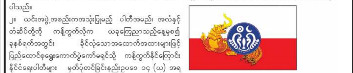
ပြည်ထောင်စုရွေးကောက်ပွဲကော်မရှင်