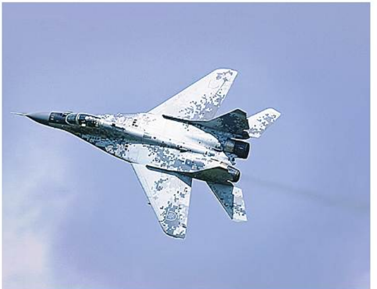
29 Fighter Jets to Ukraine ကို Slovakia to Donate 13 MiG-29 အာသာ ပြန်ဆိုထားပါသည်။

-29 တိုက်လေယာဉ်အပါအဝင် လေကြောင်းနှင့် လေကြောင်းရန်ကာကွယ်ရေး လက်နက်များတပ်ဆင်ပေးမှုအတွက် ဆလိုဗက်ကီးယားနိုင်ငံကို ကျေးဇူးတင်ရှိကြောင်း ပြောကြားခဲ့သည်။ ယူကရိန်းနိုင်ငံသည် လက်ရှိပိုင်ဆိုင်ထားသော MiG-29 အရေအတွက်ကို မကြာသေးမီက AFP သတင်းဌာနသို့ အတည်ပြုရန်ငြင်းဆိုခဲ့သော်လည်း ပြီးခဲ့သောနှစ်ကုန်ပိုင်းတွင် ထုတ်ပြန်ခဲ့သော Flight Global ၏ World Air Forces 2023 အစီရင်ခံစာအရ ၄၃ စင်းပိုင်ဆိုင်ထားကြောင်း သိရသည်။ ပိုလန်နှင့် ဆလိုဗက်ကီးယားတို့က ယူကရိန်းကိုပေးအပ်မည့် တိုက်လေယာဉ်များကို တရားဝင်ပစ်မှတ်များအဖြစ် တိုက်ခိုက် ဖျက်ဆီးပစ်မည်ဖြစ်ကြောင်း ကရင်မလင်နန်းတော်က တုံ့ပြန်ပြော