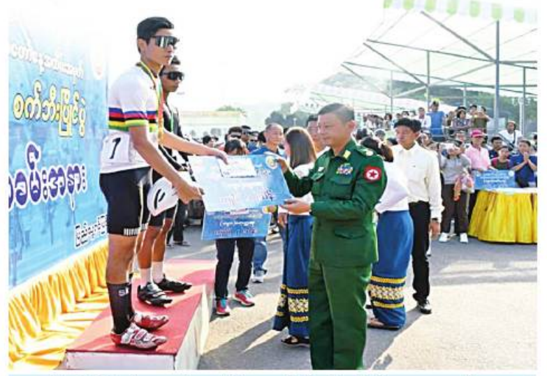
ရန်ကုန်တိုင်းစစ်ဌာနချုပ် တိုင်းမှူး ဗိုလ်ချုပ်ညွန့်ဝင်းဆွေ ဆုတံဆိပ်နှင့် ဂုဏ်ပြုချီးမြှင့်ငွေများ ပေးအပ်ချီးမြှင့်စဉ်။

နေပြည်တော် မတ် ၂၁ ရန်ကုန်တိုင်းဒေသကြီး အစိုးရအဖွဲ့၏ ဦးဆောင်မှုဖြင့် တိုင်းဒေသကြီးအားကစားနှင့် ကာယပညာဦးစီးဌာနက ကြီးမှူးကျင်းပသည့် ၂၀၂၃ ခုနှစ် (၇၈)နှစ်မြောက် တပ်မတော်နေ့အထိမ်းအမှတ် အမျိုးသား၊ အမျိုးသမီး စက်ဘီးစီးပြိုင်ပွဲကို ယနေ့နံနက်ပိုင်းတွင် သတ်မှတ်နေရာအသီးသီး၌ ပြုလုပ်ကြသည်။