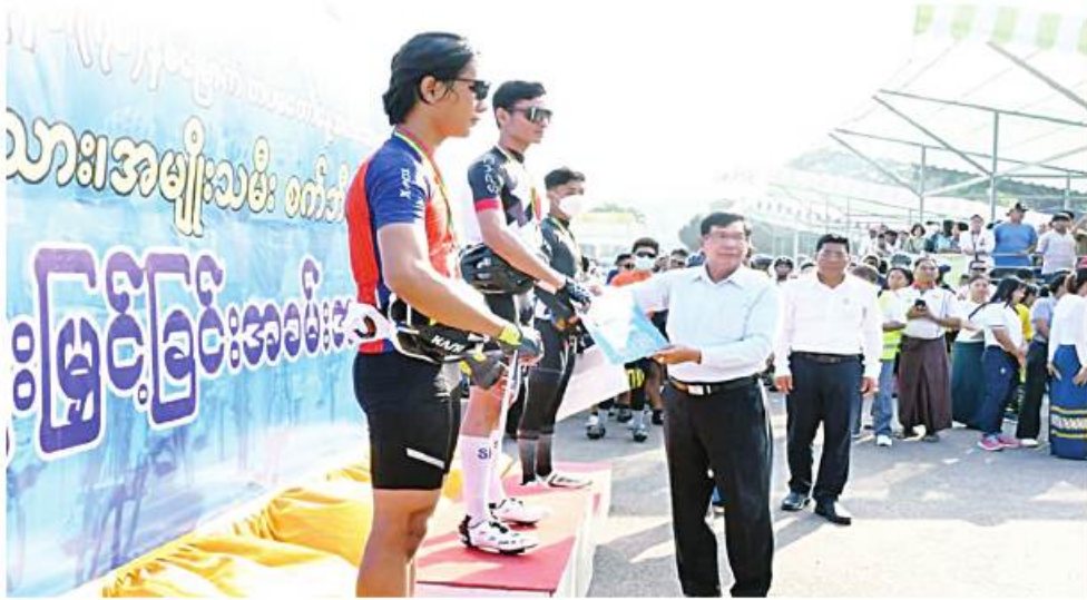
ရန်ကုန်တိုင်းဒေသကြီး ဝန်ကြီးချုပ် ဦးစိုးသိန်း ဆုတံဆိပ်နှင့် ဂုဏ်ပြုချီးမြှင့် ငွေများ ပေးအပ် ချီးမြှင့်စဉ်။