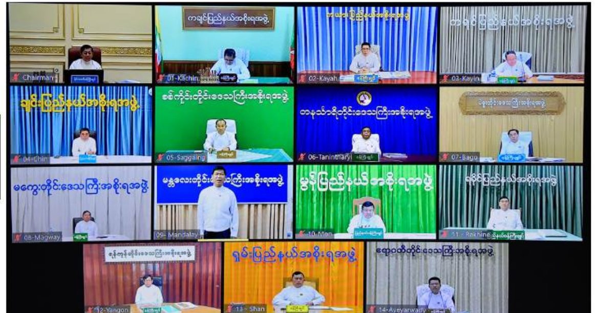
ဘဏ္ဍာရေးဆိုင်ရာကော်မရှင်(၁/ ၂၀၂၃) အစည်းအဝေးသို့ တိုင်းဒေသကြီးနှင့် ပြည်နယ်ဝန်ကြီးချုပ်များက Video Conferencing ဖြင့် တက်ရောက်ကြစဉ်။

ကြွေးမြီဆိုင်ရာ အသုံးစရိတ်များနှင့် စပ်လျဉ်းပြီး နိုင်ငံတော်က ရယူထားသည့် ပြည်ပချေးငွေများ ပြန်လည်ပေးဆပ်ရာတွင် မိမိတို့အနေဖြင့် တာဝန်သိနိုင်အဖြစ် ခံယူရပ်တည်ပြီး အချိန်စေ့ရောက်သည်