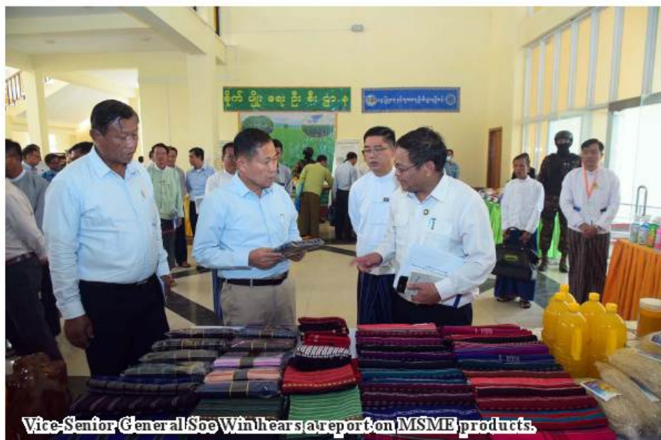
Vice-Senior General Soe Win hears a report on MSME products.

peace, stability and progress of Kayah State. As regards the regional situation and development, the Prime Minister is making continuous contacts with local government members. The formation of agencies alone is not enough for MSME development as actual functioning of MSME businesses is of vital importance. Member cards should be issued not only for MSMEs, but also for all other entrepreneurs. The cards will provide a lot of opportunities including training, marketing, involvement