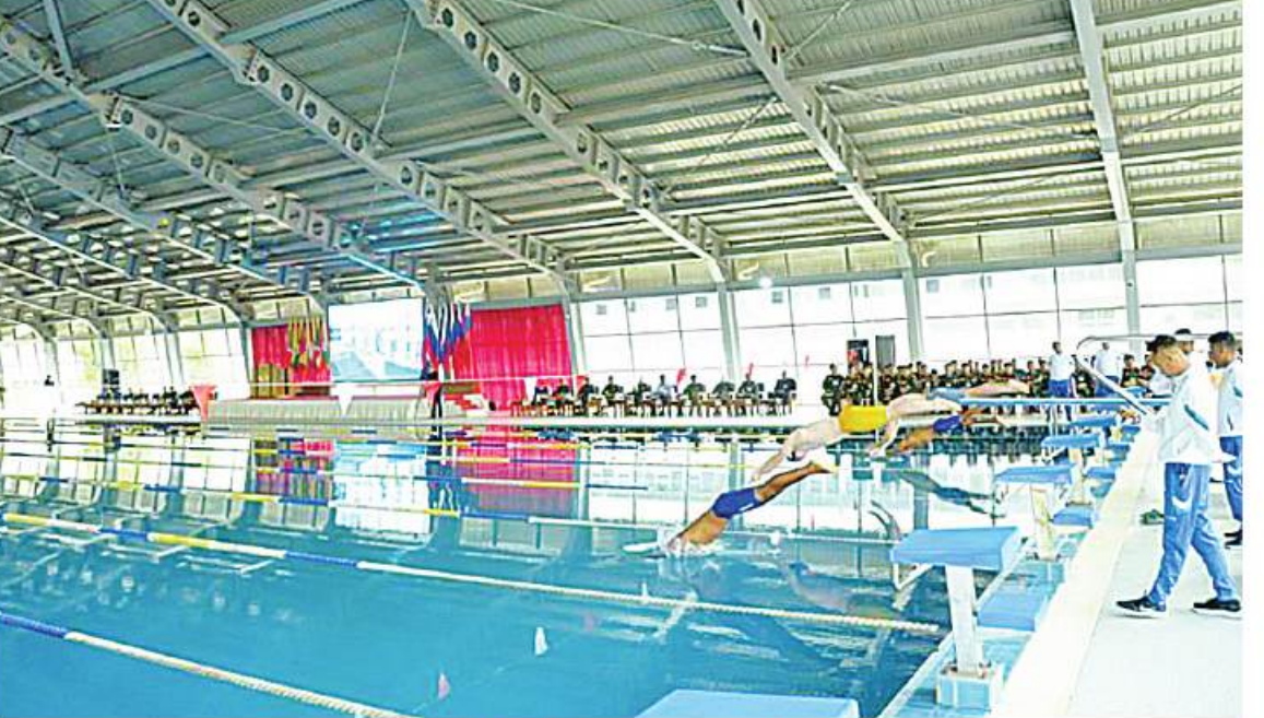
မြန်မာ-ရုရှား နှစ်နိုင်ငံပိုလ်လောင်းများရေကူးပြိုင်ပွဲ ကျင်းပစဉ်

ကြသည်။ ထို့နောက် ဆုချီးမြှင့်ပွဲနှင့် ပိတ်ပွဲအခမ်း အနားကို ဆက်လက်ကျင်းပရာ ဦးစွာ ဒုတိယတပ်မတော်လေ့ကျင့်ရေးအရာရှိချုပ် က အမှာစကားပြောကြားပြီး ပြိုင်ပွဲအသီးသီး တွင် ဆုရရှိခဲ့ကြသည့် နှစ်နိုင်ငံပိုလ်လောင်း များကို စစ်တက္ကသိုလ်ကျောင်းအုပ်ကြီးနှင့် တာဝန်ရှိသူများက ဆုများအသီးသီးပေးအပ် ချီးမြှင့်ကြပြီး စုပေါင်းမှတ်တမ်းတင်ဓာတ်ပုံ ရိုက်ကြသည်။