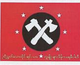
ပြည်ထောင်စုရွေးကောက်ပွဲကော်မရှင်