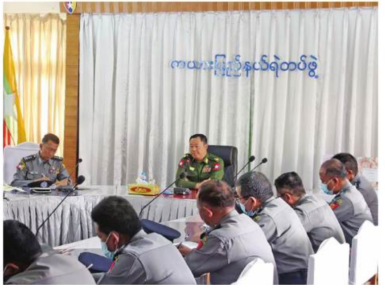
ကယားပြည်နယ်ရဲတပ်ဖွဲ့

နိုင်ငံတော်စီမံအုပ်ချုပ်ရေးကောင်စီ ဒုတိယဥက္ကဋ္ဌ ဒုတိယတပ်မတော်ကာကွယ်ရေးဦးစီးချုပ် ကာကွယ်ရေးဦးစီးချုပ်(ကြည်း) ဒုတိယဗိုလ်ချုပ်မှူးကြီးစိုးဝင်း လှိုင်ကော်မြို့ရှိ နယ်မြေခံတပ်မတော်ဆေးရုံ၌ ဆေးကုသမှုခံယူလျက်ရှိသည့် အရာရှိ စစ်သည်၊ မိသားစုဝင်များနှင့် ဒေသခံပြည်သူများ၏ ကျန်းမာရေးအခြေအနေများကို ရင်းရင်းနှီးနှီး မေးမြန်းအားပေးစကားပြောကြားစဉ်။