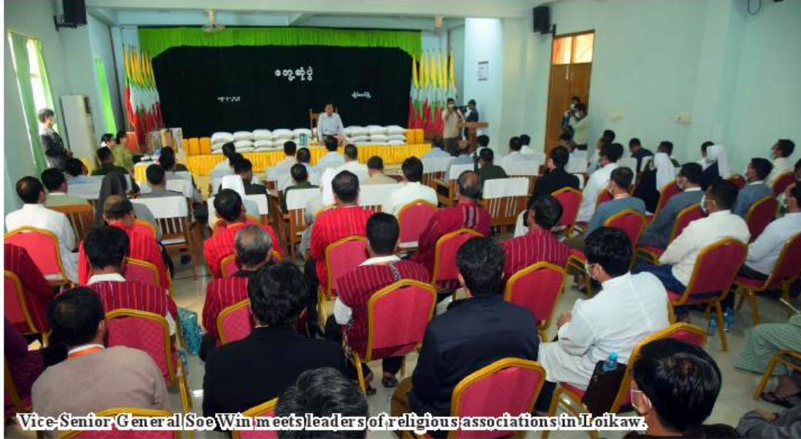
Vice-Senior General Soe Win meets leaders of religious associations in Loikaw.