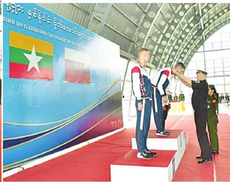
မြန်မာ-ရုရှား နှစ်နိုင်ငံပိုလ်လောင်းများရေကူးပြိုင်ပွဲတွင် ဆုရရှိသူများကို တာဝန်ရှိသူများက ဆုပေးအပ်ချီးမြှင့်စဉ်

အဆိုပါရေကူးပြိုင်ပွဲကို မြန်မာ့ တပ်မတော် ပိုလ်လောင်းများအနေဖြင့် နိုင်ငံတကာနှင့် ထိတွေ့ဆက်ဆံမှုမြှင့်တင် နိုင်ရေး ရည်ရွယ်ချက်ဖြင့် ပြုလုပ် တွင် မြန်မာနိုင်ငံမှ ပိုလ်လောင်း ၁၂ ဦးနှင့် ရုရှားနိုင်ငံမှ ပိုလ်လောင်း ၁၂ ဦး ပါဝင် ယှဉ်ပြိုင်ခဲ့ကြပြီး ပြိုင်ပွဲတွင် မီတာ ၁၀၀ လိပ်ပြာကူးပြိုင်ပွဲ၊ မီတာ ၂၀၀ အလွတ်ကူး ပြိုင်ပွဲ၊ မီတာ ၁၀၀ ပက်လက်ကူးပြိုင်ပွဲ၊ မီတာ ၁၀၀ ရင်ပေါင်တန်းကူးပြိုင်ပွဲ၊ မီတာ ၂၀၀ လိပ်ပြာကူးပြိုင်ပွဲ၊ မီတာ ၁၀၀ လေးယောက်တွဲ လက်ဆင့်ကမ်းအလွတ်ကူး ပြိုင်ပွဲ၊ မီတာ ၂၀၀ ပက်လက်ကူးပြိုင်ပွဲ၊ မီတာ ၁၀၀ အလွတ်ကူးပြိုင်ပွဲ၊ မီတာ ၅၀ လိပ်ပြာကူးပြိုင်ပွဲ၊ မီတာ ၅၀ အလွတ်ကူး ပြိုင်ပွဲ၊ မီတာ ၅၀ ပက်လက်ကူးပြိုင်ပွဲ၊ မီတာ ၅၀ ရင်ပေါင်တန်းကူးပြိုင်ပွဲ၊ မီတာ ၁၀၀ လေးယောက်တွဲ လက်ဆင့်ကမ်း လေးမျိုးကူးပြိုင်ပွဲ စသည့်ပြိုင်ပွဲများ ပါဝင်ပြီး ပြိုင်ပွဲကို မတ် ၁၄ ရက်မှ ယနေ့ထိ ကျင်းပခဲ့ခြင်းဖြစ်ကြောင်း သတင်း ရရှိသည်။