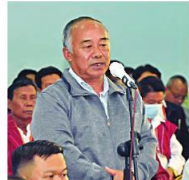
ယေဟောဝါ အသင်းတော်မှ ဦးဆီဗက်စတာ။