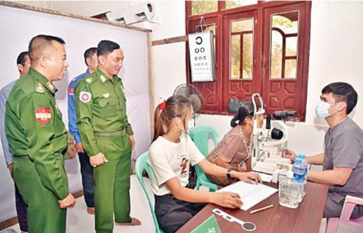
အနောက်ပိုင်းတိုင်းဝစ်ဌာနချုပ် တိုင်းမှူး ဝိုလ်ချုပ်ထင်လတ်ဦး တပ်မတော်နှင့် ကျန်းမာရေးဝန်ကြီးဌာနတို့မှ အထူးကုဆေးအဖွဲ့က ဒေသခံပြည်သူများအား ကျန်းမာရေးစောင့်ရှောက်မှုလုပ်ငန်းများ ဆောင်ရွက်ပေးနေမှုကို ကြည့်ရှုအားပေးစဉ်။

နေပြည်တော် မတ် ၁၅ ရခိုင်ပြည်နယ်အတွင်းရှိ ကမ်းရိုးတန်းဒေသတစ်လျှောက်မှ ဒေသခံပြည်သူများကို ကျန်းမာရေး စောင့်ရှောက်မှုလုပ်ငန်းများ ဆောင်ရွက်ပေးရန် ထွက်ခွာလာသည့် တပ်မတော်နှင့်ကျန်းမာရေးဝန်ကြီးဌာနတို့မှ နယ်လှည့်အထူးကုဆေးအဖွဲ့များ လိုက်ပါလာသည့် တပ်မတော်ပင်လယ်သွားဆေးရုံရေယာဉ်(သံလွင်)သည် ယနေ့တွင် မြောက်ဦးခရိုင် မြေပုံမြို့ရှိ ဆိပ်ခံတံတားသို့ရောက်ရှိရာ ဌာနဆိုင်ရာမှ တာဝန်ရှိသူများ၊ ရပ်မိရပ်ဖများနှင့်ဒေသခံပြည်သူများကသောင်းသောင်းဖြဖြကြိုဆိုကြသည်။ အဆိုပါ နယ်လှည့်အထူးကုဆေးအဖွဲ့သည် မြေပုံမြို့ရှိ ပညာပီမာန်ရိပ်သာ ပရိယတ္တိစာသင်တိုက်၌ အခြေပြု၍ အဆိုပါမြို့အတွင်းရှိ ကျေးရွာများနှင့် ပတ်ဝန်းကျင်ကျေးရွာများမှ ဒေသခံပြည်သူ ၁၄၅၉ ဦးကို ကျန်းမာရေးစောင့်ရှောက်မှုလုပ်ငန်းများ ဆောင်ရွက်ပေးသည်။ ထိုသို့ ဆောင်ရွက်ပေးရာတွင် ဆေးကုသမှုဆိုင်ရာရောဂါ ၅၇၂ ဦး၊ ခွဲစိတ်ရောဂါ ၄၁ ဦး၊ သားဖွားမီးယပ်ရောဂါ ၃၉ ဦး၊ ကလေးရောဂါ ၆၈ ဦး၊ အရိုးရောဂါ ၁၉၇ ဦး၊ နား၊ နှာခေါင်း၊ လည်ချောင်းရောဂါ ၉၆ ဦး၊ မျက်စိရောဂါ ၃၃၃ ဦးနှင့် သွားနှင့်ခံတွင်းရောဂါ ၁၁၃ ဦးတို့ကို လိုအပ်သည်ဆေးဝါးကုသမှုများ ဆောင်ရွက်ပေးသည်။ ထို့ပြင် ခွဲစိတ်ကုသရန်လိုအပ်သူ အထွေထွေခွဲစိတ်လူနာ