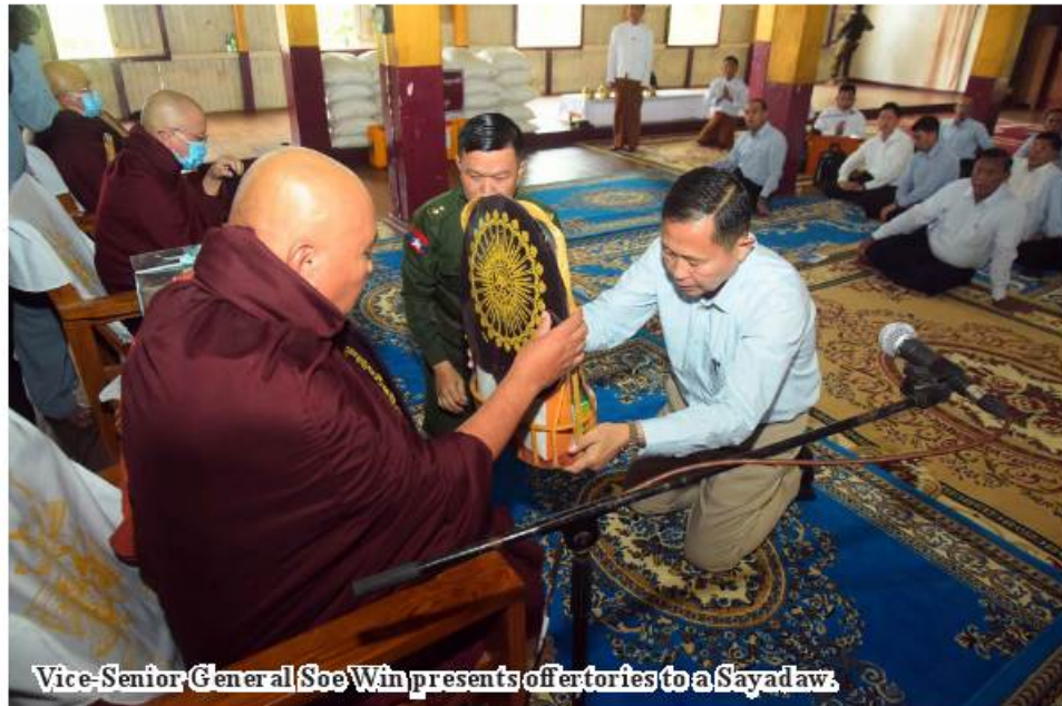
Vice-Senior General Soe Win presents offertories to a Sayadaw.

Nay Pyi Taw March 15 Vice Chairman of State Administration Council Deputy Commander-in-Chief of Defence Services Commander-in-Chief (Army) Vice-Senior General Soe Win met MSME entrepreneurs and departmental officials at Kayah State government office.