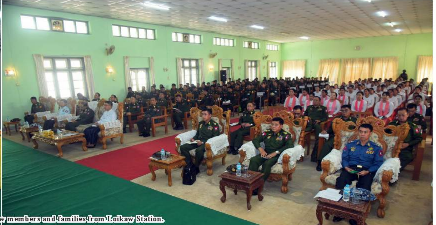
Vice-Senior General Soe Win meets Tatmadaw members and families from Loikaw Station.