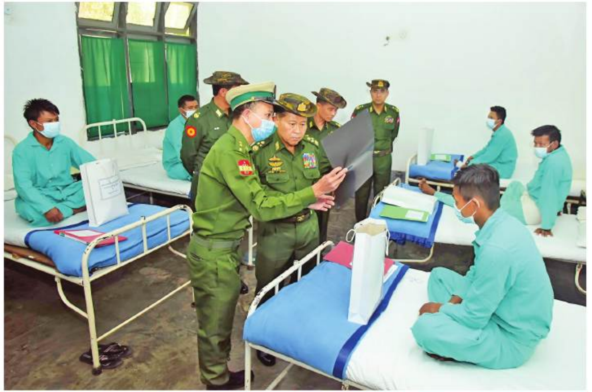
နိုင်ငံတော်စီမံအုပ်ချုပ်ရေးကောင်စီဒုတိယဥက္ကဋ္ဌ ဒုတိယတပ်မတော်ကာကွယ်ရေးဦးစီးချုပ် ကာကွယ်ရေးဦးစီးချုပ်(ကြည်း) ဒုတိယဗိုလ်ချုပ်မှူးကြီးစိုးဝင်း လှိုင်ကော်မြို့ရှိ နယ်မြေခံတပ်မတော်ဆေးရုံ၌ ဆေးကုသမှုခံယူလျက်ရှိသည့် အရာရှိ၊ စစ်သည်၊ မိသားစုဝင်များနှင့် ဒေသခံပြည်သူများ၏ ကျန်းမာရေးအခြေအနေများကို ရင်းရင်းနှီးနှီးမေးမြန်းအားပေးစကားပြောကြားစဉ်။