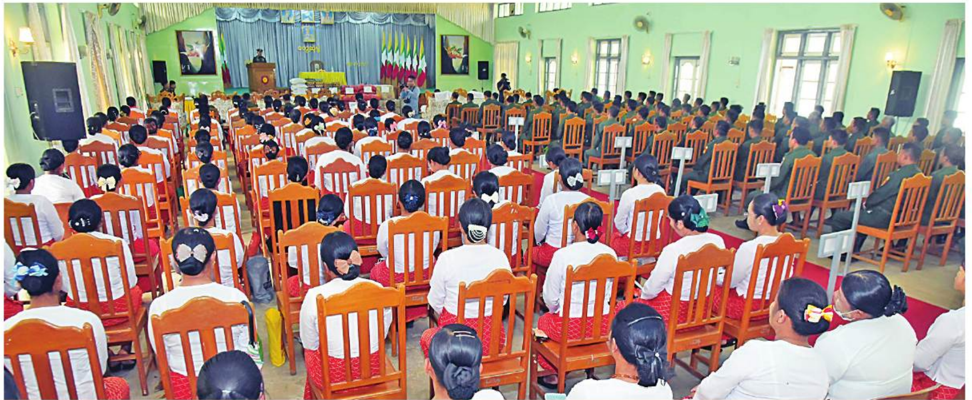
နိုင်ငံတော်စီမံအုပ်ချုပ်ရေးကောင်စီဒုတိယဥက္ကဋ္ဌ ဒုတိယတပ်မတော်ကာကွယ်ရေးဦးစီးချုပ် ကာကွယ်ရေးဦးစီးချုပ်(ကြည်း) ဒုတိယဗိုလ်ချုပ်မှူးကြီးစိုးဝင်း လှိုင်ကော်တပ်နယ်မှ အရာရှိ စစ်သည်၊ မိသားစုများအား တွေ့ဆုံအမှာစကားပြောကြားစဉ်။