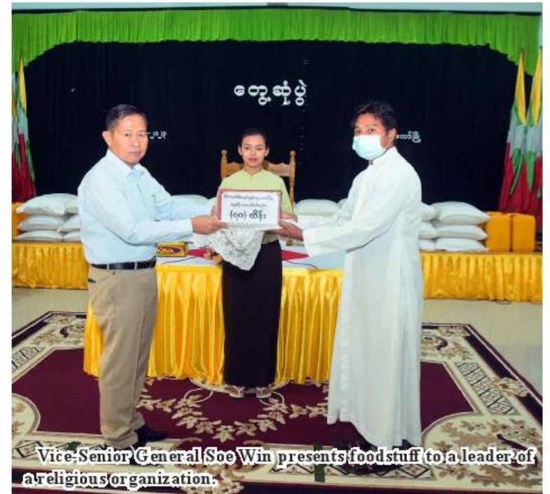
Vice-Senior General Soe Win presents foodstuff to a leader of a religious organization.