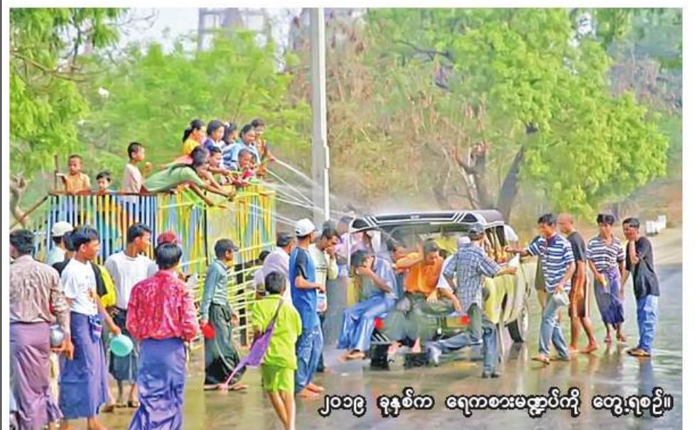
၂၀၁၉ ခုနှစ်က ရေကစားမဏ္ဍပ်ကို တွေ့ရစဉ်။

မန္တလေး မတ် ၁၅ မန္တလေး စည်ပင်နယ်နိမိတ် ခြောက်မြို့နယ်ရှိ ရပ်ကွက်များ၌ ယခုနှစ်သင်္ကြန်ပွဲတော်ကာလတွင် အသေးစားရေကစားမဏ္ဍပ်များ ခွင့်ပြုပေးသွားမည်ဖြစ်ကြောင်း မန္တလေးမြို့တော်စည်ပင်သာယာရေး ကော်မတီ အခွန်ဌာနမှ ဒုတိယ ဌာနမှူး ဦးရဲထွန်းက ပြောပြ၍ သိရသည်။ မြန်မာ့ရိုးရာအတာသင်္ကြန်ပွဲ တော်ကာလတွင် မန္တလေးမြို့ စည်ပင်နယ်နိမိတ် ခြောက်မြို့နယ် အတွင်းရှိ ရပ်ကွက်များ၌နေထိုင်ကြ သူများအနေဖြင့် အသေးစား ရေ ကစားမဏ္ဍပ်များ ဆောက်လုပ်ချင် သူများ မန္တလေးမြို့တော် စည်ပင် သာယာရေးကော်မတီအခွန်ဌာနသို့ လာရောက်လျှောက်ထားနိုင်ကြောင်း သိရသည်။ “အခုနှစ် သင်္ကြန်ကာလမှာ မန္တလေးမြို့မှာနေထိုင်ကြတဲ့ပြည်သူ တွေကို မိမိတို့အိမ်ရှေ့မှာ အသေး စားရေကစားမဏ္ဍပ်တွေဆောက် လုပ်ပြီး ရေကစားဖို့ ခွင့်ပြုပေးသွား မှာပါ။ အခုနှစ် သင်္ကြန်ပွဲတော်ကာလ မှာ မန္တလေးစည်ပင်နယ်နိမိတ် အတွင်း ရေကစားမဏ္ဍပ်တွေ ခွင့် ပြုပေးထားပေမဲ့ ရေကစားမဲ့ပြည်သူ တွေအနေနဲ့ ယာဉ်ကြောပိတ်ဆို့မှု တွေမဖြစ်အောင်တော့ သတိပြု ရေကစားကြဖို့လိုပါတယ်။ အသေး စားရေကစားမဏ္ဍပ်ဆောက်လုပ်မဲ့ ပြည်သူတွေအနေနဲ့ မန္တလေးမြို့ တော် စည်ပင်သာယာရေးကော် မတီ အခွန်ဌာနကို မတ် ၁၃ ရက် မတီ အခွန်ဌာနကို မတ် ၁၃ ရက် ကနေ ဧပြီ ၁၀ ရက်ထိ လာရောက် လာရောက်လျှောက်ထားလို့ရပါတယ်” ဟု (၁၈၄)