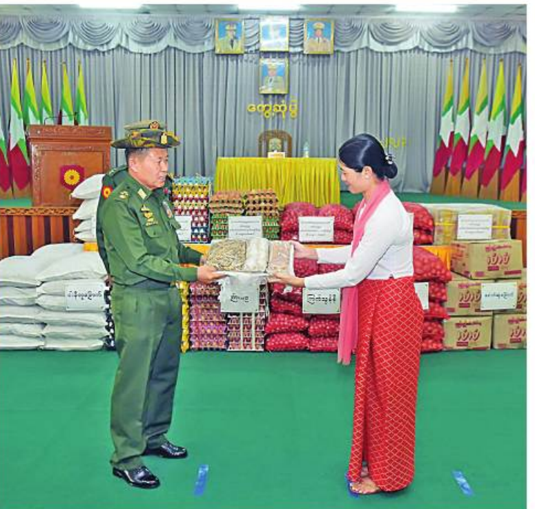
နိုင်ငံတော်စီမံအုပ်ချုပ်ရေးကောင်စီဒုတိယဥက္ကဋ္ဌ ဒုတိယတပ်မတော်ကာကွယ်ရေးဦးစီးချုပ် ကာကွယ်ရေးဦးစီးချုပ်(ကြည်း) ဒုတိယဗိုလ်ချုပ်မှူးကြီးစိုးဝင်း တပ်နယ်များရှိ အရာရှိ၊ စစ်သည်၊ မိသားစုများအတွက် စားသောက်ဖွယ်ရာများပေးအပ်ရာ တာဝန်ရှိသူများက အသီးသီးလက်ခံရယူစဉ်။