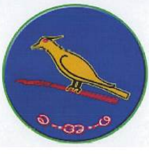
ပြည်ထောင်စုရွေးကောက်ပွဲကော်မရှင်