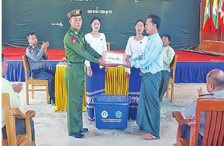
အနောက်ပိုင်းတိုင်းစစ်ဌာနချုပ်မှ တာဝန်ရှိသူတစ်ဦးက နေရပ်ပြန်ကြမည့် ယာယီနေရပ်စွန့်ခွာသူ အိမ်ထောင်စုဝင်များကို ထောက်ပံ့ငွေနှင့် လူသုံးကုန်ပစ္စည်းများ ထောက်ပံ့ပေးအပ်ခဲ့ပါ။

နေပြည်တော် မတ် ၁၅ ချင်းပြည်နယ် ပလက်ဝမြို့နယ်အတွင်းရှိ ယာယီခိုလှုံရာစခန်းများမှ မိမိသဘောဆန္ဒဖြင့် နေရပ်ပြန်ကြမည့် ယာယီနေရပ်စွန့်ခွာသူ အိမ်ထောင်စုဝင်များကို ထောက်ပံ့ငွေနှင့် လူသုံးကုန်ပစ္စည်းများ ထောက်ပံ့ပေးအပ်ခြင်းကို မတ် ၁၄ ရက် နံနက်ပိုင်းတွင် ပလက်ဝမြို့နယ်အတွင်းရှိ အနောက်ပိုင်းတိုင်းစစ်ဌာနချုပ် နယ်မြေခံတပ်မှ တာဝန်ရှိသူများ၊ ဌာနဆိုင်ရာတာဝန်ရှိသူများနှင့် နေရပ်ပြန်အိမ်ထောင်စုဝင်များ တက်ရောက်ကြသည်။ ဦးစွာ တာဝန်ရှိသူများက အားပေးအမှာစကားများ ပြောကြားကြသည်။ ထို့နောက် တာဝန်ရှိသူများက ချင်းပြည်နယ်အစိုးရအဖွဲ့က ထောက်ပံ့သည့် အိမ်ထောင်စုတစ်စုလျှင် ငွေကျပ် ၅၀၀၀၀၀ နှုန်းဖြင့် အိမ်ထောင်စု ၂၀ အတွက် ငွေကျပ်သိန်း ၁၀၀ ကိုလည်းကောင်း၊ ဘေးအန္တရာယ်ဆိုင်ရာ စီမံခန့်ခွဲမှုဦးစီးဌာနက ထောက်ပံ့သည့် ဆန်ရိက္ခာဖိုးငွေ တစ်လစာအတွက် လူတစ်ဦးလျှင် ၉၀၀၀ ကျပ်နှုန်းဖြင့် လူဦးရေ ၁၀၅ ဦးအတွက် ထောက်ပံ့ငွေကျပ် ၉၄၅၀၀၀ ကိုလည်းကောင်း၊ ဘေးအန္တရာယ်ဆိုင်ရာ စီမံခန့်ခွဲမှုဦးစီးဌာနကထောက်ပံ့သည့် အိမ်ထောင်စုတစ်စုလျှင် လူသုံးကုန်ပစ္စည်း ၁၇ မျိုးပါသည့် Family Kit တစ်စုံနှုန်းဖြင့် Family Kit ပိုး ၂၀ ကိုလည်းကောင်း စခန်းတာဝန်ခံများထံ အသီးသီး ထောက်ပံ့ပေးအပ်ကြသည်။ ဆက်လက်၍ ပြည်နယ်အစိုးရအဖွဲ့နှင့် တပ်မတော်တို့မှ စီစဉ်ဆောင်ရွက်ပေးမှုဖြင့် ပလက်ဝမြို့နယ်အတွင်းရှိ ယာယီခိုလှုံရာစခန်းများမှ ငှားတို့၏ နေရပ်အသီးသီးသို့ ပြန်လည်သွားရောက်နေထိုင်ကြမည့် ယာယီနေရပ်စွန့်ခွာသူ အိမ်ထောင်စုဝင်များ၏ အိမ်သုံးကုန်ပစ္စည်းများကို နယ်မြေခံတပ်မတော်သားများ၊ မြန်မာနိုင်ငံရဲတပ်ဖွဲ့ဝင်များ၊ မီးသတ်တပ်ဖွဲ့ဝင်များနှင့် ဌာနဆိုင်ရာဝန်ထမ်းများက စက်လှေများပေါ်သို့ ကူညီသယ်ယူပို့ဆောင်ပေးကြပြီး ငှားတို့၏ နေရပ်ကျေးရွာများအရောက် အခမဲ့ပို့ဆောင်ပေးခဲ့ကြောင်း သတင်းရရှိသည်။