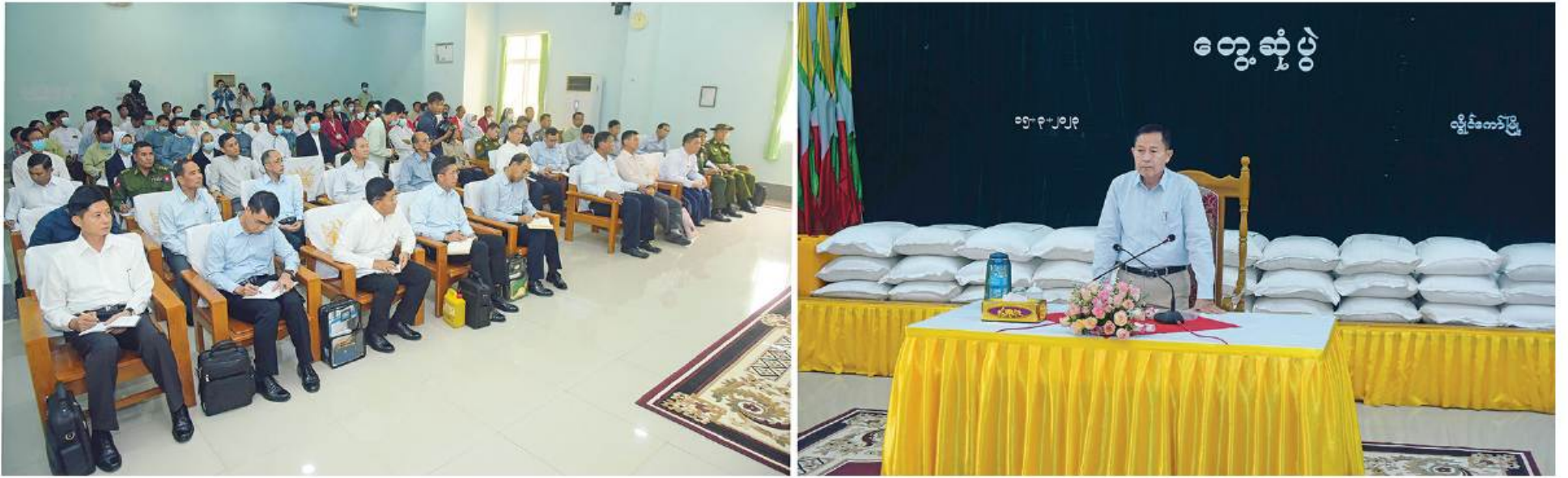
နိုင်ငံတော်စီမံအုပ်ချုပ်ရေးကောင်စီဒုတိယဥက္ကဋ္ဌ ဒုတိယတပ်မတော်ကာကွယ်ရေးဦးစီးချုပ် ကာကွယ်ရေးဦးစီးချုပ်(ကြည်း) ဒုတိယဗိုလ်ချုပ်မှူးကြီးစိုးဝင်း လွိုင်ကော်မြို့ရှိ ဘာသာရေးအသင်းအဖွဲ့ခေါင်းဆောင်များအား တွေ့ဆုံအမှာစကားပြောကြားစဉ်။

နေပြည်တော် မတ် ၁၅ နိုင်ငံတော် စီမံအုပ်ချုပ်ရေးကောင်စီ ဒုတိယဥက္ကဋ္ဌ ဒုတိယတပ်မတော်ကာကွယ်ရေးဦးစီးချုပ် ကာကွယ်ရေးဦးစီးချုပ်(ကြည်း) ဒုတိယဗိုလ်ချုပ်မှူးကြီးစိုးဝင်းသည် ယနေ့ နံနက်ပိုင်းတွင် လွိုင်ကော်မြို့ရှိ ကက်သလစ် သာသနာ့အသင်းတော်၊ နှစ်ခြင်း ခရစ်ယာန်အသင်းတော်၊ ကယားဖူးနှစ်ခြင်း ခရစ်ယာန်အသင်းတော်၊ အင်္ဂလိကန် အသင်းတော်၊ ယေဟောဝါအသင်းတော်၊ သတ္တမနေ့ဥပုသ်အသင်းတော်နှင့် ကေ့ထိုး ဘိုးရိုးရာအဖွဲ့များမှ ဘာသာရေး ခေါင်းဆောင်များကို ပြည်နယ်အစိုးရအဖွဲ့ ရုံးခန်းမ၌ တွေ့ဆုံသည်။ တွေ့ဆုံပွဲသို့ နိုင်ငံတော်စီမံအုပ်ချုပ်ရေး ကောင်စီဝင်များဖြစ်ကြသည့် ပိုးရယ် အောင်သိန်း၊ ဦးခွန်စံလွင်၊ ကယားပြည်နယ် ဝန်ကြီးချုပ် ဦးဇော်မျိုးတင်၊ ကာကွယ်ရေး ဦးစီးချုပ်မှူးမှ တပ်မတော်အရာရှိကြီးများ၊ အရှေ့ပိုင်းတိုင်းစစ်ဌာနချုပ် တိုင်းမှူး ဝိုင်းလှိုင်လှိုင်၊ ဒုတိယဝန်ကြီးများ၊ တာဝန် ရှိသူများနှင့် ဘာသာရေးအသင်းအဖွဲ့များမှ