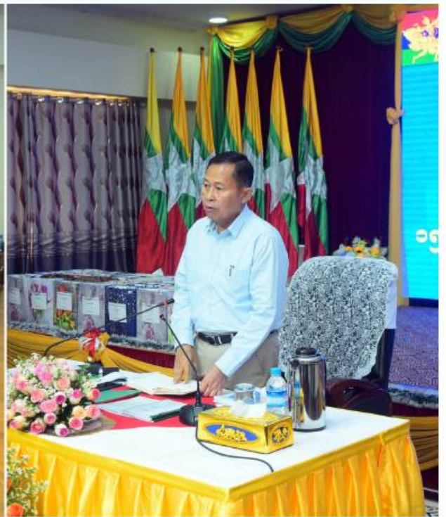
နိုင်ငံတော်စီမံအုပ်ချုပ်ရေးကောင်စီဒုတိယဥက္ကဋ္ဌ ဒုတိယတပ်မတော်ကာကွယ်ရေးဦးစီးချုပ် ကာကွယ်ရေးဦးစီးချုပ်(ကြည်း) ဒုတိယဗိုလ်ချုပ်မှူးကြီးစိုးဝင်း ကယားပြည်နယ်အတွင်းရှိ အသေးစား၊ အငယ်စားနှင့် အလတ်စား(MSME)စီးပွားရေးလုပ်ငန်းရှင်များနှင့် ဌာနဆိုင်ရာတာဝန်ရှိသူများကို တွေ့ဆုံအမှာစကားပြောကြားစဉ်။

နေပြည်တော် မတ် ၁၅ ရေးဦးစီးချုပ် ကာကွယ်ရေးဦးစီးချုပ်(ကြည်း) ဦးစီးချုပ် ကာကွယ်ရေးဦးစီးချုပ်(ကြည်း) စစ်ဌာနချုပ် တိုင်းမှူး ဗိုလ်ချုပ်လှမိုး၊ ဒုတိယဝန်ကြီး ကယားပြည်နယ်အတွင်းရှိ အသေးစား၊ ဒုတိယဗိုလ်ချုပ်မှူးကြီးစိုးဝင်း ကယားပြည်နယ် ဒုတိယဗိုလ်ချုပ်မှူးကြီးစိုးဝင်းနှင့်အတူ နိုင်ငံတော် များ၊ ကယားပြည်နယ်အတွင်းရှိ အသေးစား၊အငယ် အငယ်စားနှင့် အလတ်စား(MSME) စီးပွားရေး အစိုးရအဖွဲ့ ရုံးအစည်းအဝေးခန်းမ၌ သွားရောက် ပြည်နယ်အစိုးရအဖွဲ့ဝင်များ ဖြစ်ကြသည့် စားနှင့် အလတ်စားစီးပွားရေးလုပ်ငန်းရှင်များ၊ လုပ်ငန်းရှင်များနှင့် ဌာနဆိုင်ရာတာဝန်ရှိသူများကို တွေ့ဆုံအမှာစကားပြောကြားသည်။ ဝန်းရယ်အောင်သိန်း၊ ဦးခွန်စံလွင်၊ ကယားပြည်နယ် ပြည်နယ်အစိုးရအဖွဲ့ဝင်များနှင့် ဌာနဆိုင်ရာတာဝန် ယနေ့နံနက်ပိုင်းတွင် နိုင်ငံတော်စီမံအုပ်ချုပ်ရေး တွေ့ဆုံပွဲသို့ နိုင်ငံတော်စီမံအုပ်ချုပ်ရေးကောင်စီ ရှိသူများ တက်ရောက်ကြသည်။ ကောင်စီဒုတိယဥက္ကဋ္ဌ ဒုတိယတပ်မတော်ကာကွယ် ဒုတိယဥက္ကဋ္ဌ ဒုတိယတပ်မတော်ကာကွယ်ရေး ခန်းမှ တပ်မတော်အရာရှိကြီးများ၊ အရှေ့ပိုင်းတိုင်း