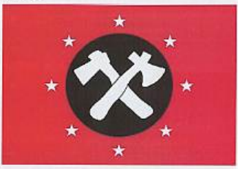
ညီညွတ်သောတိုင်းရင်းသားလူမျိုးများဒီမိုကရေစီပါတီ (United Nationalities Democracy Party)၏ တံဆိပ်ပုံစံ