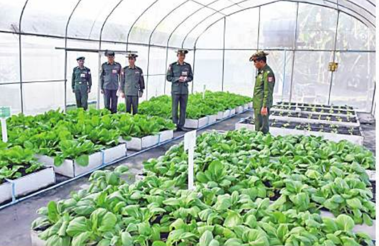
အနောက်တောင်တိုင်းစစ်ဌာနချုပ် တိုင်းမှူး ဝိုင်းစုဗိုလ်မှူးမှ ဝန်ထမ်းများအား ပြန်လည်ပေးအပ်ခဲ့ပါ။

နေပြည်တော် မတ် ၁၅ တိုင်းစစ်ဌာနချုပ် တိုင်းမှူး ဝိုင်းစုဗိုလ်မှူးမှ ဝန်ထမ်းများအား ပြန်လည်ပေးအပ်ခဲ့ပါ။ တိုင်းစစ်ဌာနချုပ် တိုင်းမှူး ဝိုင်းစုဗိုလ်မှူးမှ ဝန်ထမ်းများအား ပြန်လည်ပေးအပ်ခဲ့ပါ။