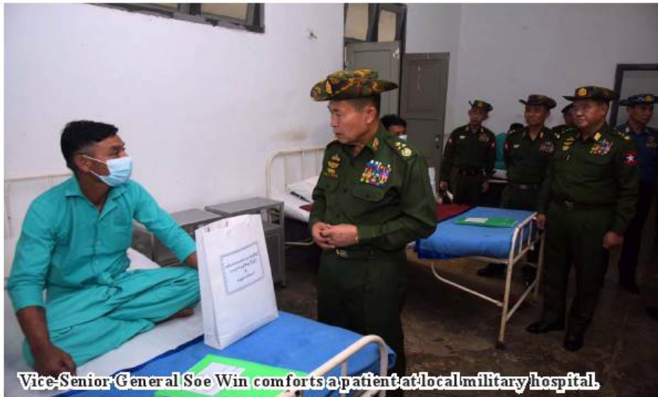
Vice-Senior General Soe Win comforts a patient at local military hospital.

to have access to entitlements and welfare such as salaries, allowances, ration, accommodation, travel, meals, health and education provided by the State and the Tatmadaw without delays. Tatmadaw members and their families for their part need to serve their duties dutifully. They also need to be healthy to be able to carry out family duties. So, they need