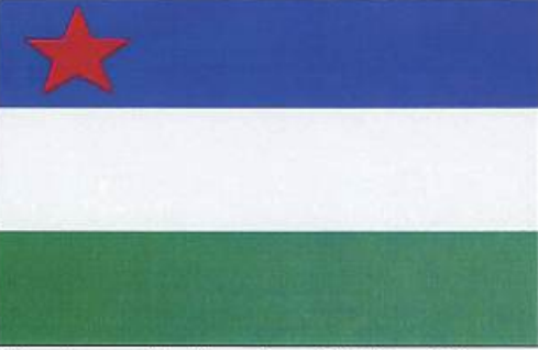
ခမီအမျိုးသားဖွံ့ဖြိုးတိုးတက်ရေးပါတီ၏ တံဆိပ်ပုံစံ