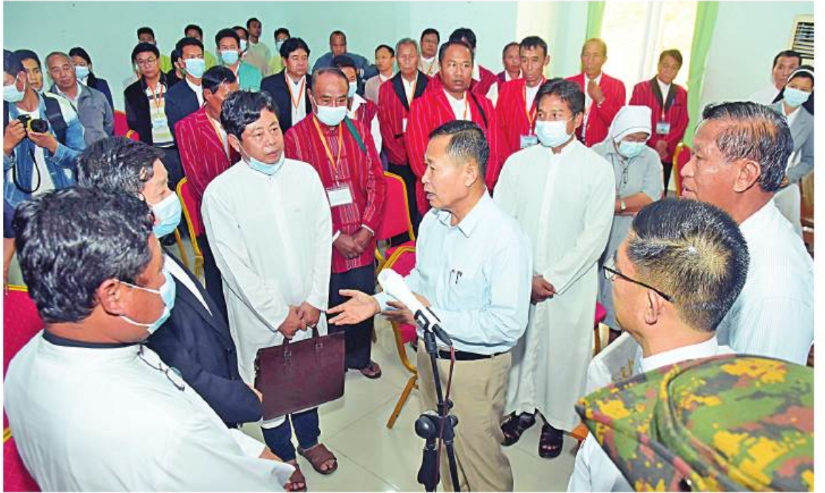
နိုင်ငံတော်စီမံအုပ်ချုပ်ရေးကောင်စီဒုတိယဥက္ကဋ္ဌ ဒုတိယတပ်မတော်ကာကွယ်ရေးဦးစီးချုပ် ကာကွယ်ရေးဦးစီးချုပ်(ကြည်း) ဒုတိယဗိုလ်ချုပ်မှူးကြီးစိုးဝင်း လှိုင်ကော်မြို့ရှိ ဘာသာရေးအသင်းအဖွဲ့ခေါင်းဆောင်များအား ရင်းရင်းနှီးနှီးနှုတ်ဆက်စဉ်။

အေးချမ်းရေးအတွက် သက်ဆိုင်ရာ တာဝန်ရှိသူများနှင့် ပူးပေါင်းပေးရန် ပြောကြားလိုကြောင်း၊ ဘာသာရေး အဖွဲ့အစည်းများ၏ ဘာသာရေး၊ လူမှုရေးဆိုင်ရာ လုပ်ဆောင်မှုများနှင့်ပတ်သက်၍ သံသယရှိစရာ အကြောင်းမရှိပါကြောင်း၊ သို့သော် ပြောငုံမတ်မှန်ကန်စွာ လုပ်ကိုင်ရန်လိုကြောင်း၊ ယေဘုယျအားဖြင့် ကျေးဇူးတော်၊ မေတ္တာတော်နှင့် လုပ်ကိုင်ဆောင်ရွက်မှုများကို အားပေးကြောင်း၊ မှန်ကန်သောနည်းလမ်းနှင့် အထောက်အပံ့ပေးမှု