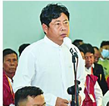
နှစ်ခြင်းခရစ်ယာန်အသင်းတော်မှ ဖာသာအက်ဒွတ်စ်နီ။