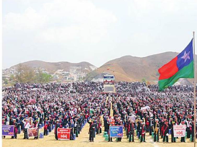
နေပြည်တော် မတ် ၁၅ ရမ်းပြည်နယ်(တောင်ပိုင်း) ပင်လောင်းမြို့နယ် နမ့်နိမ်ကျေးရွာအတွင်းသို့ မတ် ၁၁ ရက်တွင် KNDF/KNPP အဖွဲ့ နှင့် PDF အမည်ခံအကြမ်းဖက်သမားများက လက်နက်ကြီး၊ လက်နက်ငယ်များဖြင့် အကြောင်းမဲ့ရက်စက်မိုက်ခဲစွာ ပစ်ခတ်တိုက်ခိုက်မှုကြောင့် နမ့်နိမ်ကျေးရွာရှိ ဘုန်းတော်ကြီး

ပအိုဝ်း ကိုယ်ပိုင်အုပ်ချုပ်ခွင့်ရဒေသအတွင်း KNDF/KNPP အဖွဲ့နှင့် PDF အမည်ခံ အကြမ်းဖက်သမားများက ပအိုဝ်းသံဃာတော်များနှင့် လူမျိုးများကို လူမဆန်စွာသတ်ဖြတ်မှုအပေါ် ပြင်းထန်စွာ ဆန့်ကျင်ရှုတ်ချကြောင်း ဆန္ဒထုတ်ဖော်စဉ်။ ကျောင်းမှ သံဃာတော်သုံးပါး ပျံလွန်တော်မူခဲ့ပြီး အပြစ်မဲ့ ဒေသခံပြည်သူ ၁၇ ဦး ထိခိုက်သေဆုံးခဲ့ကြောင်း သိရသည်။ အဆိုပါဖြစ်စဉ်နှင့်ပတ်သက်၍ ပြင်းထန်စွာ ဆန့်ကျင်ရှုတ်ချကြောင်းကို ယနေ့တွင် ရဟန်းသံဃာတော်များနှင့် အကြမ်းဖက်မှုကိုမလိုလားသော ဒေသခံပြည်သူများက တောင်ကြီးမြို့ ကံကြီးရပ်ကွက်ရှိ ပအိုဝ်းအမျိုးသား ဘက်စုံဖွံ့ဖြိုးတိုးတက်ရေးကွင်း၌ စုပေါင်း၍ ဆန္ဒထုတ်ဖော်ကြသည်။ ဆန္ဒထုတ်ဖော်ရာတွင် ပအိုဝ်းဒေသအတွင်း ကျွေးကျော်စစ်တလင်းဖန်တီးမှု အလိုမရှိ၊ အပြစ်မဲ့ ပအိုဝ်းသံဃာတော်များနှင့် ပအိုဝ်းလူမျိုးများကိုသတ်ဖြတ်မှု အလိုမရှိ၊ သတင်းမှန် ဖုံးကွယ်ရေးသားဖော်ပြသော မီဒီယာများ အလိုမရှိ၊ ပအိုဝ်းပြည်သူလူထုပိုင်ပစ္စည်းဥစ္စာများကို အတင်းအဓမ္မခိုးယူနေသော အကြမ်းဖက်သမားများအလိုမရှိ၊ သာသနာ့အဆောက်အအုံများ၊ ပြည်သူ့လူထုနေအိမ်များကို မီးရှို့ဖျက်ဆီးမှုများ အလိုမရှိ၊ ကျေးရွာနှင့် လူနေအိမ်များ ဒေသများကို လူသားဒိုင်းကာအဖြစ် အသုံးပြုမှုများ အလိုမရှိ၊ KNDF နှင့် အကြမ်းဖက် PDF အပေါင်းအပါများ ပအိုဝ်းဒေသအတွင်းမှ အမြန်ဆုံးဆုတ်ခွာရေး ဒို့အရေး၊ ပြည်ထောင်စုသမ္မတမြန်မာနိုင်ငံတော်နှင့် ပအိုဝ်းဒေသ တည်ငြိမ်အေးချမ်းရေး ဒို့အရေး စသည့် ကြွေးကြော်သံများ ကြွေးကြော်၍ ပိုစတာများ၊ ဆိုင်းဘုတ်များကိုင်ဆောင်ကာ ငြိမ်းချမ်းစွာ ဆန္ဒထုတ်ဖော်ခဲ့ကြကြောင်း သတင်းရရှိသည်။