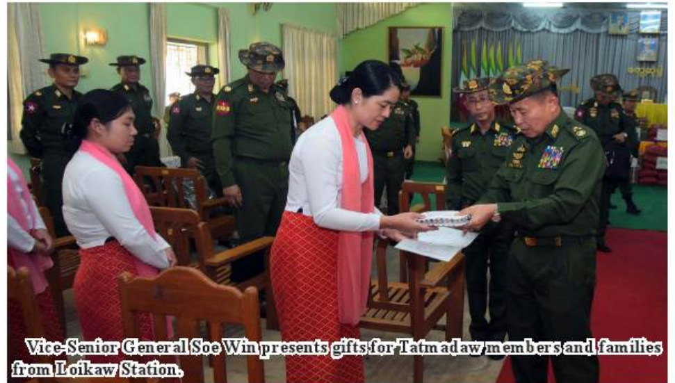
Vice-Senior General Soe Win presents gifts for Tatmadaw members and families from Loikaw Station.