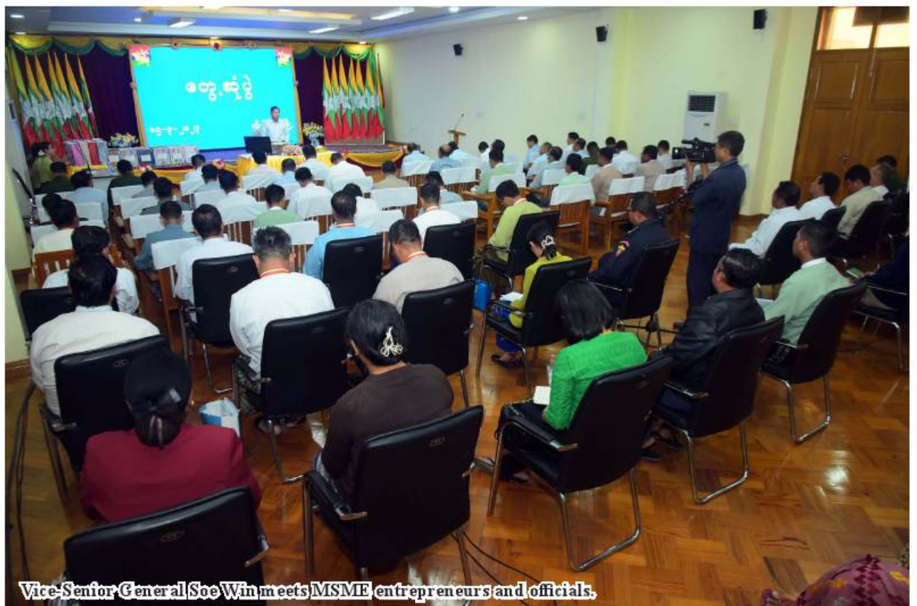
Vice-Senior General Soe Win meets MSME entrepreneurs and officials.

The State Administration Council has provided Kayah State with a capital of Ks 10 billion from the State economic development fund in order that the Kayah State