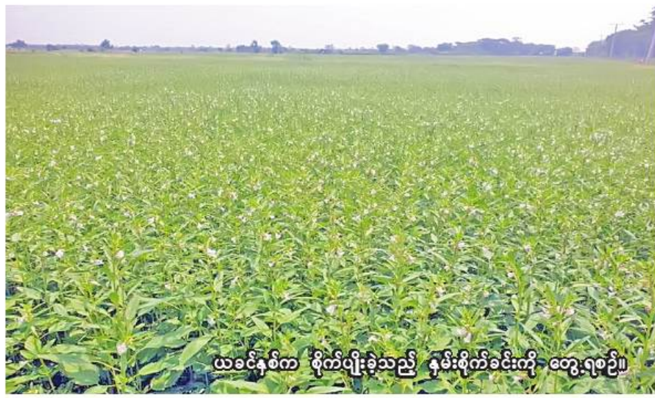
ယခင်နှစ်က စိုက်ပျိုးခဲ့သည့် နွေနှမ်းစိုက်ခင်းကို တွေ့ရစဉ်။

ရေဦးခရိုင်အတွင်း နွေနှမ်းစိုက်ပျိုးမှုတိုးချဲ့နိုင်ရေး၊ GAP နည်းစနစ်ဖြင့် စိုက်ပျိုးနိုင်ရေး၊ မျိုးကောင်းမျိုးသန့်များ စိုက်ပျိုးနိုင်ရေးအတွက် မြို့နယ်စိုက်ပျိုးရေးဦးစီးဌာနက အသိပညာပေးလျက်ရှိကြောင်း သိရသည်။ (၂၀၆)