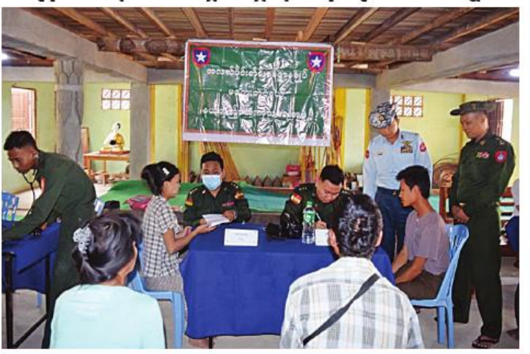
အလယ်ပိုင်းတိုင်းစစ်ဌာနချုပ် နယ်မြေခံဆေးကုသရေးအဖွဲ့က မကွေးမြို့နယ် တည်ပင်ကန်ပေါက်ကျေးရွာ၌ ဒေသခံပြည်သူများကို ကျန်းမာရေးစောင့်ရှောက်မှု လုပ်ငန်းများ ဆောင်ရွက်ပေးစဉ်။

နေပြည်တော် မတ် ၁၁ စစ်တိုင်းတိုင်းဒေသကြီး မုံရွာမြို့နယ် ကောရဗျကျေးရွာရှိ သံယာတော်များနှင့် ဒေသခံပြည်သူ ၆၇ ဦးတို့ကို အဆိုပါ ကျေးရွာ ဘုန်းတော်ကြီးကျောင်း၌ လည်းကောင်း၊ မကွေးတိုင်းဒေသကြီး လှည်းကောင်း၊ မကွေးတိုင်းဒေသကြီး မကွေးမြို့နယ် တည်ပင်ကန်ပေါက်ကျေးရွာ ရှိ သံယာတော်များနှင့် ဒေသခံပြည်သူ ၁၆၂ ဦးတို့ကို အဆိုပါကျေးရွာ ရှိ ရတနာ့ဂုဏ်ရည်ကျောင်းတိုက်၌ လည်းကောင်း ယနေ့တွင် သက်ဆိုင်ရာ တိုင်းစစ်ဌာနချုပ်များမှ နယ်မြေခံဆေးကုသ ရေးအဖွဲ့များက ကျန်းမာရေးစောင့်ရှောက် မှုလုပ်ငန်းများ ဆောင်ရွက်ပေးသည်။