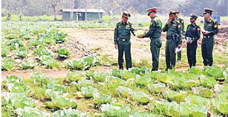
အရှေ့အလယ်ပိုင်း တိုင်းစစ်ဌာနချုပ် တိုင်းမှူး ဗိုလ်ချုပ်မျိုးမင်းထွန်း နယ်မြေခံ တပ်ရင်းများ၌ ရာသီသီးနှံများ စိုက်ပျိုးထားရှိမှုကို ကြည့်ရှုစစ်ဆေးစဉ်။

နေပြည်တော် မတ် ၁၁ ကိုစစ်-၁၉ ရောဂါဖြစ်ပွားမှုကြောင့် ရောဂါကာကွယ်၊ ထိန်းချုပ်၊ ကုသရေး လုပ်ငန်းများ ဆောင်ရွက်နေချိန်တွင် ဒေသ တွင်း စားရေရိက္ခာဖူလုံရေးနှင့် ပြည်သူ များ၏စားသောက်ရေးကို အထောက်အကူ ဖြစ်စေရန်အတွက် တိုင်းစစ်ဌာန ချုပ်များ၊ တပ်ရင်း၊ တပ်ဖွဲ့များ၌ စိုက်ပျိုး၊ မွေးမြူရေးလုပ်ငန်းများကို ဆောင်ရွက်