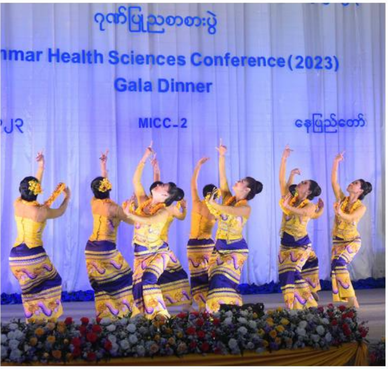
နိုင်ငံတော်စီမံအုပ်ချုပ်ရေးကောင်စီဒုတိယဥက္ကဋ္ဌ ဒုတိယဝန်ကြီးချုပ် ဒုတိယဗိုလ်ချုပ်မှူးကြီးစိုးဝင်း မြန်မာနိုင်ငံကျန်းမာရေးပညာရပ်ဆိုင်ရာနှီးနှောပလ္လယ်ပွဲ(၂၀၂၃) ဂုဏ်ပြုညစာစားပွဲတွင် အနုပညာဦးစီးဌာနမှ အနုပညာရှင်များ၏ တေးသံသာများဖြင့် သီဆိုကပြဖော်ပြမှုကို ကြည့်ရှုအားပေးစဉ်။

နေပြည်တော် မတ် ၁၁ ရှင်းပဟိုဌာန-၂၅ ကျင်းပရာ နိုင်ငံတော်စီမံအုပ်ချုပ်ရေးကောင်စီဒုတိယဥက္ကဋ္ဌ ဒုတိယဝန်ကြီးချုပ် ဒုတိယဗိုလ်ချုပ်မှူးကြီးစိုးဝင်း တက်ရောက်ချီးမြှင့်သည်။ အခမ်းအနားသို့ နိုင်ငံတော်စီမံအုပ်ချုပ်ရေးကောင်စီဝင်များ၊ ပြည်ထောင်စုဝန်ကြီးများ၊ တာဝန်ရှိသူများတက်ရောက်ကြသည်။ မြန်မာနိုင်ငံ ကျန်းမာရေးပညာရပ်ဆိုင်ရာ နှီးနှောပလ္လယ်ပွဲ(၂၀၂၃) အထိမ်းအမှတ်ဂုဏ်ပြု ဝတ်မတော်အရာရှိကြီးများ၊ ဒုတိယဝန်ကြီးများ၊ ထို့နောက် နိုင်ငံတော်စီမံအုပ်ချုပ်ရေးကောင်စီ ဒုတိယဗိုလ်ချုပ်မှူးကြီးစိုးဝင်း တက်ရောက် အမြဲတမ်းအတွင်းဝန်များ၊ ညွှန်ကြားရေးမှူးချုပ်များ၊ ဒုတိယဥက္ကဋ္ဌ ဒုတိယဝန်ကြီးချုပ်သည် အခမ်းအနား ဝါမောက္ခချုပ်များ၊ နယ်ပယ်အသီးသီးမှ ဆေးနှင့် သို့တက်ရောက်လာကြသူများနှင့်အတူ ဂုဏ်ပြု ချီးမြှင့်သည်။ အခမ်းအနားသို့ နိုင်ငံတော်စီမံအုပ်ချုပ်ရေး ဆေးနှီးနှယ်ပညာရှင်များ၊ ဖိတ်ကြားထားသူများနှင့် ညစာကို စာမျက်နှာ ၁၈ ကော်လံ ၅ ။