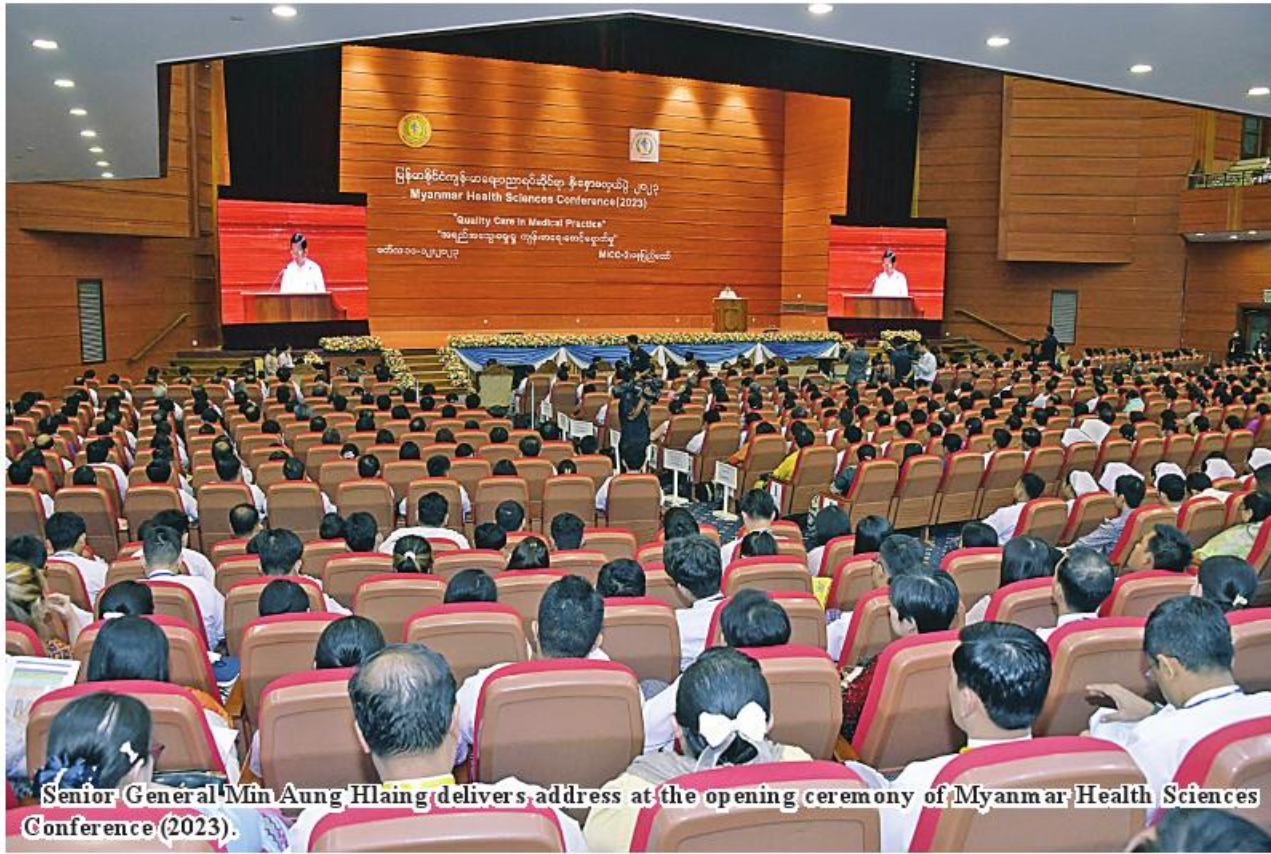
Senior General Min Aung Hlaing delivers address at the opening ceremony of Myanmar Health Sciences Conference (2023).

Nay Pyi Taw March 11 Opening ceremony of Myanmar Health Sciences Conference (2023) was held at Myanmar International Convention Center II in Nay Pyi Taw at 8.30 am today, addressed by Chairman of State Administration Council Prime Minister Senior General Min Aung Hlaing.