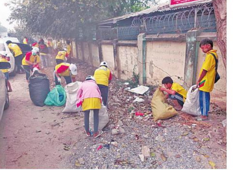
မန္တလေးမြို့ပေါ်ရှိ တာဝန်သိလူငယ်လူရွယ်များစုစည်း၍ “မြို့ရွာသန့်ရှင်း ရောဂါကင်း စုပေါင်းအမှိုက်ရှင်း” စာသားတံဆိပ်ပါ တူညီဝတ်စုံများ ဝတ်ဆင်ပြီး အမှိုက်(၃၁) အခြေခံပညာအထက်တန်းကျောင်း ကျောင်းဝင်း အတွင်းအပြင်နှင့် (၅၈)လမ်း သံလမ်းဘေးဝဲယာတို့၌ စုပေါင်းအမှိုက်ကောက်စဉ်။ စေရန် ပြည်သူများထံမှ အမှိုက်တစ်ပိဿာ လျှင် ၁၀၀ ကျပ်ဖြင့် ဝယ်ယူ၍ စနစ်တကျ အမှိုက်စွန့်ပစ်ခြင်းများကို ဆောင်ရွက် ကြသည်။ ယင်းသို့ ဆောင်ရွက်ပေးနေမှုများကို သက်ဆိုင်ရာ တိုင်းစစ်ဌာနချုပ်အသီးသီးမှ တိုင်းမှူးများနှင့် တာဝန်ရှိသူများက လိုက်လံကြည့်ရှုအားပေးပြီး လိုအပ်သည် များ ညှိနှိုင်းဆောင်ရွက်ပေးခဲ့ကြကြောင်း သတင်းရရှိသည်။

လည်းကောင်း ဘုရား၊ စေတီပုထိုးများ၊ ဌာနဆိုင်ရာအဆောက်အအုံများ၊ အခြေခံ ပညာကျောင်းများ၊ တက္ကသိုလ်များ၊ ဆေးရုံ များ၊ ဘိုးဘွားရိပ်သာများ၊ ဈေးများ၊ ပန်းခြံ များနှင့် လမ်း၊ တံတားများ၌ ဒေသခံပြည်သူ များ၊ အုပ်ချုပ်ရေးအဖွဲ့အစည်းများ၊ စည်ပင်သာယာရေးအဖွဲ့များ၊ ကြက်ခြေနီ တပ်ဖွဲ့ဝင်များ၊ ဌာနဆိုင်ရာဝန်ထမ်းများ၊ စစ်မှုထမ်းဟောင်းအဖွဲ့ဝင်များ၊ ပြည်သူ့စစ် တပ်ဖွဲ့ဝင်များ၊ တပ်မတော်သားများ၊ မြန်မာနိုင်ငံရဲတပ်ဖွဲ့ဝင်များနှင့် မီးသတ် တပ်ဖွဲ့ဝင်များက ချဲ့နှယ်ပေါင်းမြက်များ ခုတ်ထွင်ရှင်းလင်းခြင်း၊ အမှိုက်များ ရှင်းလင်းခြင်း၊ ရေစီးရေလာကောင်းမွန် စေရေး ရေနုတ်မြောင်းများ တူးဖော် ပေးခြင်းနှင့် ခြင်ဆေးဖျန်းပေးခြင်းတို့ကို ဆောင်ရွက်ပေးကြသည်။ ထို့ပြင် မန္တလေးမြို့ပေါ်ရှိ တာဝန်သိ လူငယ်လူရွယ်များစုစည်း၍ “မြို့ရွာ သန့်ရှင်းရေးဂါကင်း စုပေါင်းအမှိုက်ရှင်း” စာသားတံဆိပ်ပါ တူညီဝတ်စုံများဝတ်ဆင် ပြီး အမရပူရမြို့နယ် တောင်သမန်အင်း အနောက်ဘက်ခြမ်းဝန်းကျင်၌ စုပေါင်းအမှိုက် ကောက်ခြင်းနှင့် ရပ်ကွက်နေပြည်သူများ တစ်ဖက်တစ်လမ်းမှ သက်သာချောင်ချိမှုရှိ