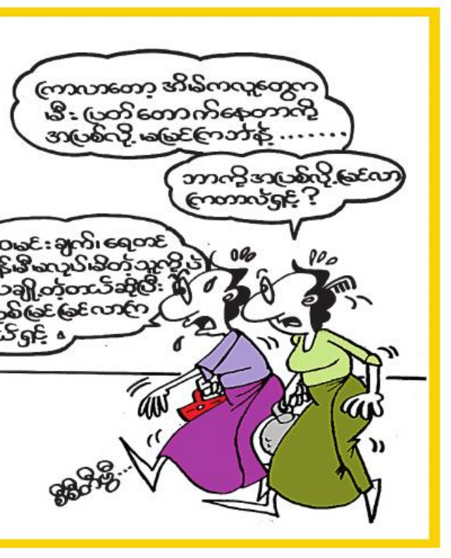
ကြားလာတော့ အိမ်ကလူတွေက မီး ဖြတ်တောက်နေတာကို အပြစ်လို့ မမြင်လာဘဲနဲ့..... ဘာကိုအပြစ်လို့ မြင်လာ ကြတာလဲရှင်? ထမင်းချက်၊ ရေထင် အချိန်မီမလုပ်မိတ်သူတို့ပဲ။ ဒီရိသချိုတဲ့တယ်ဆိုပြီး အပြစ်မြင်မြင်လာကြ တယ်ရှင်။