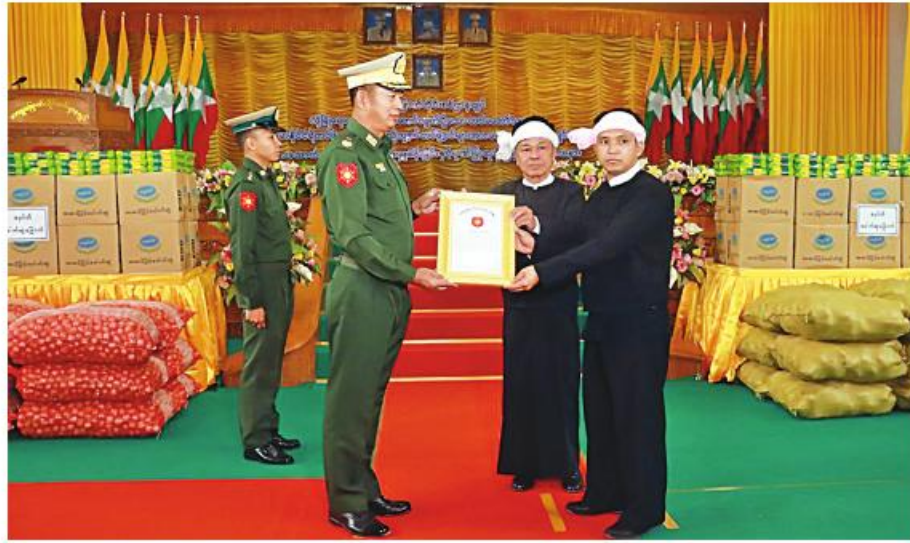
အရှေ့မြောက်တိုင်း ဝစ်ဌာနချုပ် တိုင်းမှူး ဗိုလ်ချုပ်ခင်နိုင်ဦး လုံခြုံရေး တပ်ဖွဲ့ဝင်များကို ဂုဏ်ပြုချီးမြှင့်သည့် အလှူရင်များ အား ဂုဏ်ပြု မှတ်တမ်းလွှာ ပေးအပ်စဉ်။

နေပြည်တော် မတ် ၁၁ ရှမ်းပြည်နယ်(မြောက်ပိုင်း) အတွင်း လုံခြုံရေးတာဝန်များ ထမ်းဆောင်လျက် ရှိသော တပ်မတော်သားများ၊ မြန်မာနိုင်ငံ ရဲတပ်ဖွဲ့ဝင်များနှင့် ပြည်သူ့စစ်(ဌာန) တပ်ဖွဲ့ဝင်များကို စေတနာရှင်အလှူရှင်များ က စားသောက်ဖွယ်ရာများ ဂုဏ်ပြုပေးအပ် ခြင်းကို ယနေ့နံနက်ပိုင်းတွင် အရှေ့မြောက် တိုင်းစစ်ဌာနချုပ်ရှိ တိုင်းခန်းမ၌လှူလှူရာ တိုင်းမှူး ဗိုလ်ချုပ်ခင်နိုင်ဦးနှင့် အဖွဲ့ဝင်များ၊ ဌာနဆိုင်ရာတာဝန်ရှိသူများ၊ လုံခြုံရေး တပ်ဖွဲ့ဝင်များနှင့် စေတနာရှင်အလှူရှင် များ တက်ရောက်ကြသည်။