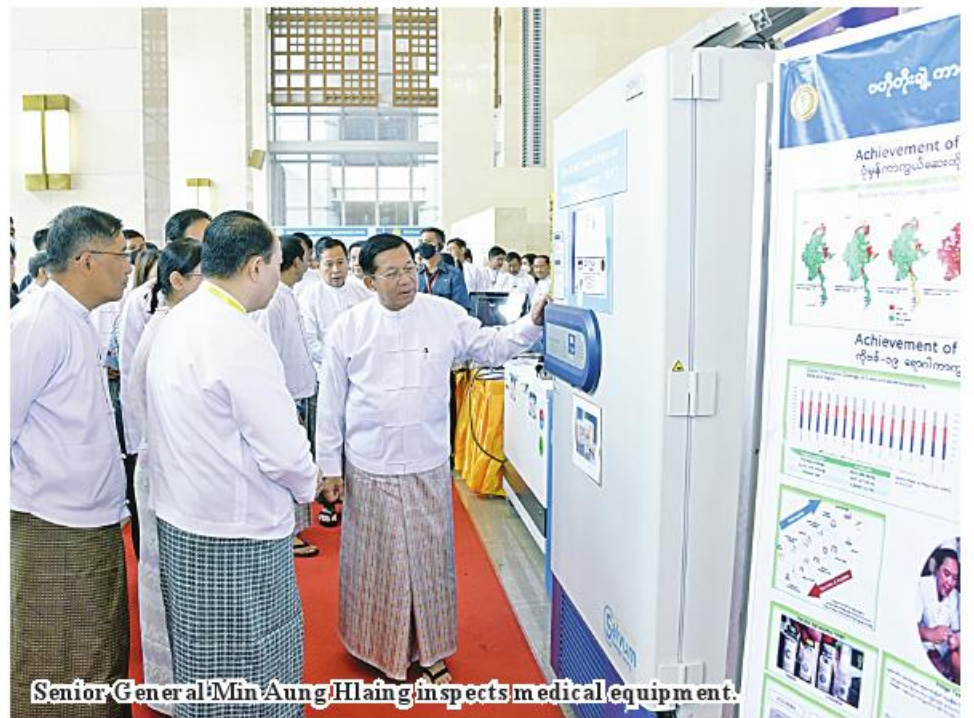
Senior General Min Aung Hlaing inspects medical equipment.

In taking measures for development of the healthcare sector to enhance longevity and health of the entire national people, it is necessary to carry out tasks for emergence of a