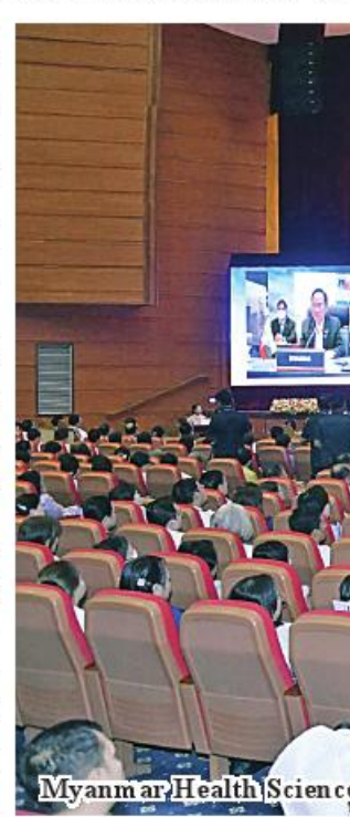
Myanmar Health Sciences Conference (2023) in progress.

of the Ministry of Health is conducting research constantly with the aim of enhancing the health status of the people. The department must be congratulated on successfully conducting researches on Myancopharm and related medicines, Withama fever medicine produced by the