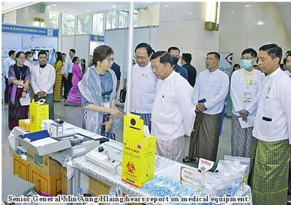
Senior General Min Aung Hlaing hears report on medical equipment.

It is a common knowledge that SAC has been promoting the health standard of the national people. Covid-19 Prevention, Control and Treatment Central Committee led by the Senior General, and Covid-19 Control and Emergency Response Committee led by the Vice-Senior General and bodies at all levels were set up, necessary tasks performed in time in order to prevent, contain and respond the Covid-19 epidemic that severely threatened life of the peoples and healthcare systems of global countries and to end its evil consequences on