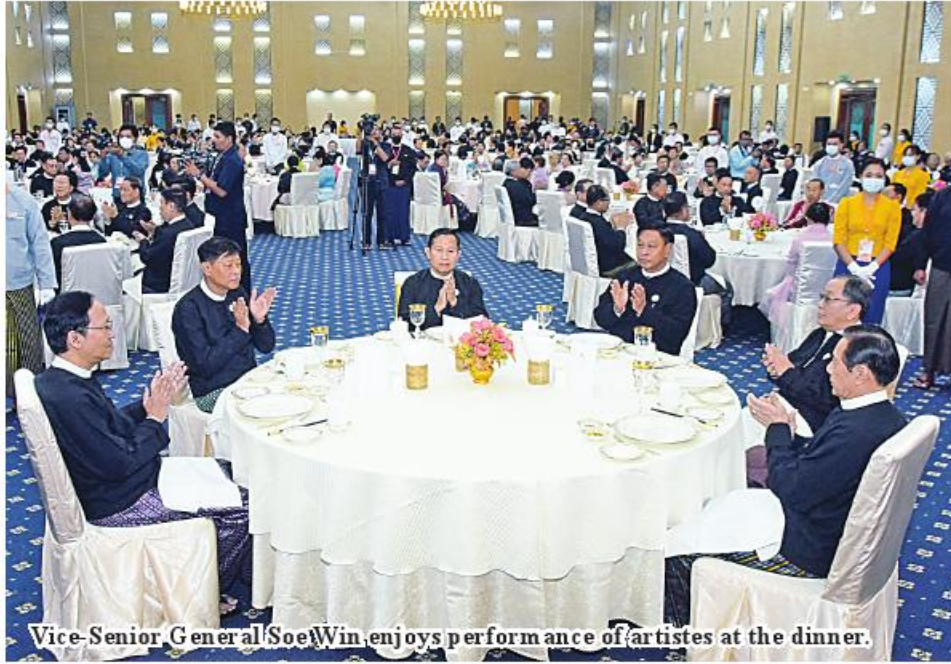
Vice-Senior General Soe Win enjoys performance of artistes at the dinner.

Nay Pyi Taw March 11 Vice-Senior General Soe Win attended a dinner in honour of Myanmar Health Sciences Conference 2023 evening. The dinner was hosted at Myanmar International Convention Center -2 in Nay Pyi Taw this evening.