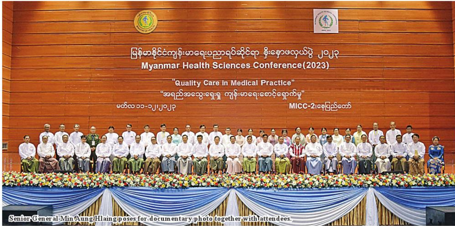
Senior General Min Aung Hlaing poses for documentary photo together with attendees.