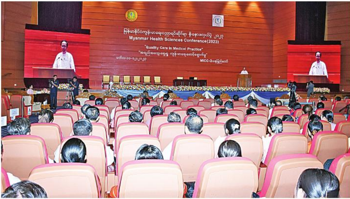
ပြည်ထောင်စုဝန်ကြီး ဒေါက်တာသက်ခိုင်ဝင်း မြန်မာနိုင်ငံကျန်းမာရေးပညာရပ်ဆိုင်ရာနီးနှောဖလှယ်ပွဲ (၂၀၂၃) တွင် အမှာစကားပြောကြားစဉ်။

နေပြည်တော် မတ် ၁၁ မြန်မာနိုင်ငံ ကျန်းမာရေးပညာရပ်ဆိုင်ရာ နီးနှောဖလှယ်ပွဲ (၂၀၂၃) ကို ယနေ့နံနက်ပိုင်းတွင် နေပြည်တော်ရှိ မြန်မာအပြည်ပြည်ဆိုင်ရာ ကွန်ပင်းရှင်း ဗဟိုဌာန(၂)၌ ကျင်းပရာ ကျန်းမာရေးဝန်ကြီး