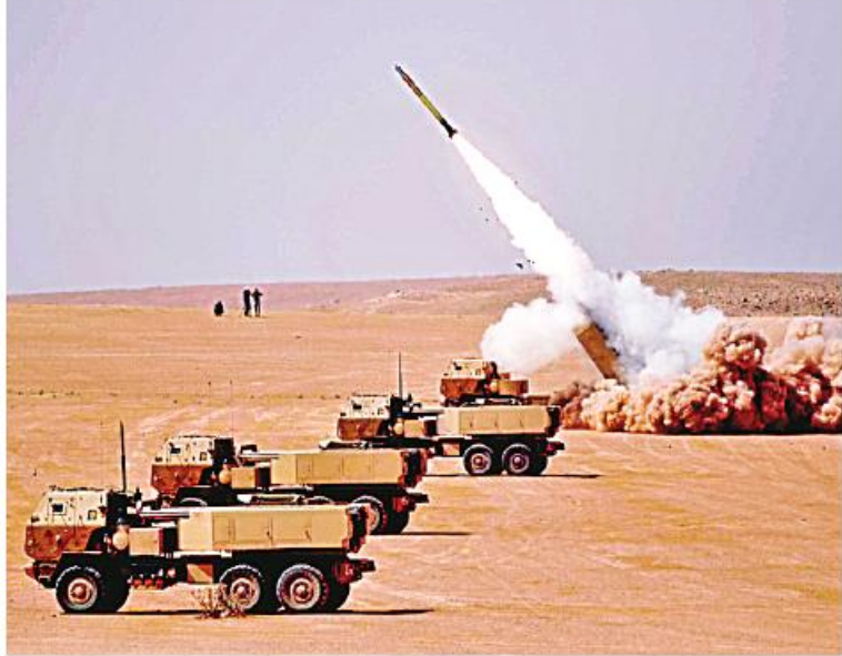
အမေရိကန်နိုင်ငံကြည်းတပ်အမှတ်(၅) (HIMARS) လက်နက်စနစ်အပြန်အလှန် သည် ဥရောပရှိမိတ်ဖက်နိုင်ငံများ၏ High Mobility Artillery Rocket System မည်ဖြစ်ကြောင်း မတ် ၆ ရက်က Defense

Post တွင် ရေးသားထားသည်။ ဥရောပနိုင်ငံများကြား European HIMARS Initiative (EHI) ဟုခေါ် သော အဆိုပါကြိုးပမ်းမှုသည် မဟာမိတ် နိုင်ငံများ အဖျက်စွမ်းအား၊ အပြန် အလှန်လုပ်ဆောင်နိုင်မှုနှင့် စစ်မြေပြင် အမြောက်လက်နက် ကျွမ်းကျင်မှုတို့ကို တည်ဆောက်ရန် ဘက်စုံချဉ်းကပ်မှုကို အာရုံစိုက်လုပ်ဆောင်လာကြသည်။ စီမံ ကိန်းလုပ်ဆောင်ရာတွင် HIMARS အတွဲလိုက် ခုံးပစ်လောင်ချာစနစ်များ ပိုင်ဆိုင်သော သို့မဟုတ် ဝယ်ယူရန် စိတ်ဝင်စားသော မဟာမိတ်နိုင်ငံများကို ကမ်းလှမ်းမည်ဖြစ်သည်။ EHI ရှေ့ပြေးလုပ်ဆောင်မှုများအောက် တွင် နိုင်ငံများသည် HIMARS ခုံးပစ် လောင်ချာများ၏ထိရောက်မှု၊ လေ့ကျင့်မှု နှင့် ဖြန့်ဖြူးမှုတို့ကိုဆွေးနွေးရန် ထိပ်တန်း ခေါင်းဆောင် ထိပ်သီးအစည်းအဝေးတစ်