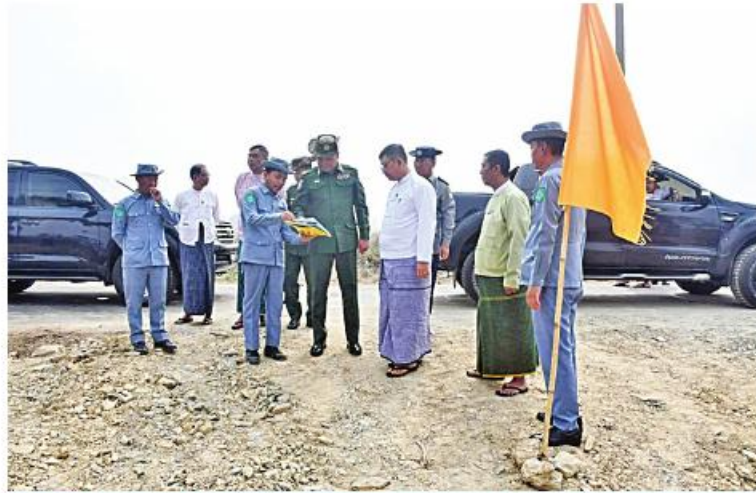
မွန်ပြည်နယ်ဝန်ကြီးချုပ် ဦးအောင်ကြည်သိန်းနှင့် တိုင်းမှူး ဗိုလ်ချုပ်မြတ်သက်ဦး တို့က ကလို့ရွာရှောင်လမ်းဖောက်လုပ်မည့်အခြေအနေကို ကြည့်ရှုစစ်ဆေးစဉ်။

နေပြည်တော် မတ် ၉ မွန်ပြည်နယ် ချောင်းဆုံမြို့နယ် ဒရယ် ကျေးရွာမှ တောင်စွန်းကျေးရွာသို့ ဆက်သွယ်မည့် ၈၂၅ ပေရှိ ကလို့ ရွာရှောင်လမ်း မြေသားလမ်းနှင့် ကျောက် ရောမြေ၊ ဂဝံခင်းခြင်းလုပ်ငန်းဆောင်ရွက် မည့်နေရာသို့ ယနေ့နံနက်ပိုင်းတွင် ပြည်နယ်ဝန်ကြီးချုပ် ဦးအောင်ကြည်သိန်း၊ အရှေ့တောင်တိုင်းစစ်ဌာနချုပ် တိုင်းမှူး ဗိုလ်ချုပ်မြတ်သက်ဦးနှင့် တာဝန်ရှိသူများက သွားရောက်ကြည့်ရှုစစ်ဆေးရာ တာဝန်ရှိသူ တစ်ဦးကရှင်းလင်းတင်ပြသည်။ ယင်းနောက် ပြည်နယ်ဝန်ကြီးချုပ်နှင့် တိုင်းမှူးတို့က လိုအပ်သည်များ ပေါင်းစပ်ညှိနှိုင်းဆောင် ရွက်ပေးခဲ့ကြောင်း သတင်းရရှိသည်။