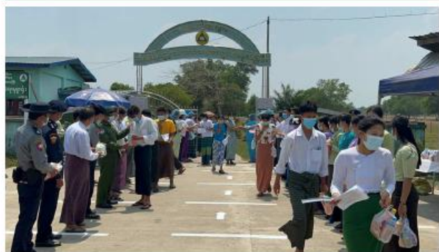
၂၀၂၃ ခုနှစ် တက္ကသိုလ်ဝင်စာမေးပွဲ ဒုတိယနေ့အဖြစ် အင်္ဂလိပ်စာဘာသာရပ် ဆက်လက်ဖြေဆို

အကြမ်းဖက်သမားများကို အားပေးမှု၊ ထောက်ခံမှု၊ ကူညီထောက်ပံ့မှုမပြုခြင်းသည် ပြည်သူ့လူထု၏ အသက်အိုးအိမ်စည်းစိမ်ကို ကာကွယ်ပေးခြင်းဖြစ်သည်။ ၃။ ယင်းတို့၏လက်နက်၊ ခဲယမ်းကိုတွယ်သယ်ဆောင်မှုနှင့် အကြမ်းဖက်သမားတို့၏သတင်းကို လျှို့ဝှက်ပေးပို့ခြင်းသည် အပြစ်မပြည်သူများ၏ အသက်အိုးအိမ်စည်းစိမ်ကို ကာကွယ်ပေးခြင်းဖြစ်သည်။