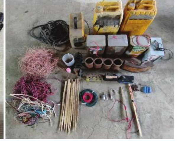
PDF အမည်ခံ အကြမ်းဖက်သမားများ သိုဝှက်သိမ်းဆည်းထားသည့် လက်နက်၊ ခဲယမ်းများနှင့် ဆက်စပ်ပစ္စည်းများ သိမ်းဆည်းရမိမှုမှတ်တမ်းဓာတ်ပုံ။

သိမ်းဆည်းထားသည့်အကြမ်းဖက်သမားများကိုအမြန်ဆုံးဖမ်းဆီးရမိရေးဒေသခံပြည်သူများ အေးချမ်းတည်ငြိမ်စွာ နေထိုင်နိုင်ရေး