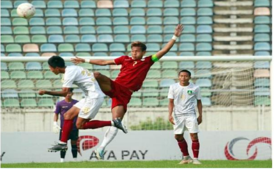
မြဝတီအက်ဖ်စီအသင်းနှင့် ရော့တီယူနိုက်တက်အသင်းတို့ ယှဉ်ပြိုင်ကစားနေမှုကို တွေ့ရစဉ်။

ရန်ကုန် မတ် ၉ မြန်မာနေရှင်နယ်လိဂ်ပြိုင်ပွဲ ပွဲစဉ်(၄)အဖြစ် ယနေ့ညနေပိုင်းက ရန်ကုန်မြို့ သုဝဏ္ဏအားကစားကွင်းတွင် မြဝတီအက်ဖ်စီအသင်းနှင့် ရော့တီယူနိုက်တက်အသင်းတို့ ယှဉ်ပြိုင်ကစားကြရာ အပြန်အလှန်သွင်းဂိုးများဖြင့် မြဝတီအက်ဖ်စီအသင်းက သုံးဂိုး နှစ်ဂိုးဖြင့် အနိုင်ရရှိခဲ့ကြောင်းသိရသည်။ အဆိုပါပွဲစဉ်၌ ပွဲစတင်တည်းက နှစ်သင်းလုံး ခြေစွမ်းပိုင်းကွာခြားမှုမရှိဘဲ အပြန်အလှန်ဖိအားပေးမှုများဖြင့်