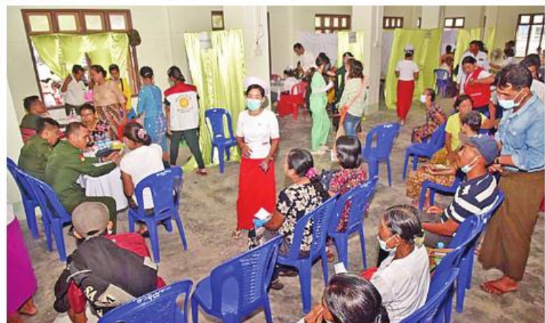
တပ်မတော်ပင်လယ်သွားဆေးရုံရေယာဉ်(သံလွင်) ရခိုင်ပြည်နယ်မာန်အောင်မြို့နယ် အတွင်းရှိ ဒေသခံပြည်သူများကို ကျန်းမာရေးစောင့်ရှောက်မှုလုပ်ငန်းများဆောင်ရွက် ပေးစဉ်။

ကုသရန် လိုအပ်သူတစ်ဦးကို နီးစပ်ရာ တပ်မတော်ဆေးရုံသို့ တက်ရောက်ကုသ နိုင်ရေး စီစဉ်ဆောင်ရွက်ပေးသည်။ ယင်းသို့ ဆောင်ရွက်ပေးနေမှုများကို တာဝန်ရှိသူများက လိုက်လံကြည့်ရှုအားပေး ပြီး လိုအပ်သည်များ ညှိနှိုင်းဆောင်ရွက် ပေးသည်။ ကျန်းမာရေးဆောင်ရွက်ပေးမှု အပေါ် ဒေသခံပြည်သူများ၏ စကားသံများကို ယခုလိုပဲကြားသိခဲ့ရပါမည်- “ကျွန်တော်တို့ တပ်မတော်နယ်လှည့် ဆေးကုသရေးအဖွဲ့ လာမယ်ဆိုတာသိလို့ ဒီမှာလာပြတာပါ။ အကုန်လုံးအဆင်ပြေ တယ်။ သူတို့စမ်းသပ်ပေးတယ်။ ကုန်းမြေ ထိစပ်တဲ့နေရာမဟုတ်ဘူး။ သီးသန့်ကျွန်း လေးတစ်ခုဖြစ်နေတဲ့အခါ ကျန်းမာရေးနဲ့ ပတ်သက်တဲ့ အများကြီးအခက်အခဲရှိတယ်။ ဒီမှာကလည်း ဆရာဝန်တွေလုံလောက်မှု မရှိတာကြောင့် တောင်ကုတ်၊ သံတွဲ၊ ရန်ကုန်တွေမှာသွားပြရတယ်။ တောင်ကုတ် ဆိုရင် မိုင် ၄၀ ကျော်သွားရတယ်။ အထူး သဖြင့် မိုးရာသီမှာဆိုရင် ပြည်သူတွေ အနေနဲ့ တော်တော်လေးအခက်အခဲတွေ ကြုံတယ်။ အခုတောင် တပ်မတော်နယ်လှည့် ဆေးကုသရေးအဖွဲ့ လာမယ်ဆိုတာကြားက တချို့တွေက ဝမ်းပန်းတသာနဲ့ စောင့်မျှော်နေတာကြာပါပြီ။ ခွဲစိတ်ဖို့ လိုတဲ့သူတွေလည်း ခွဲစိတ်ဖို့ လိုသလို တပ်မတော်က ဆေးစစ်မှုကို လိုလေသေးမရှိ လုပ်ပေးတဲ့အတွက်