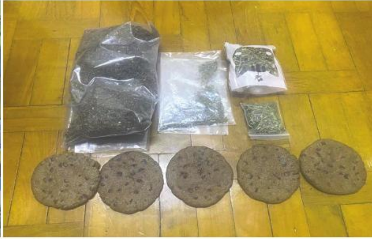
၂၀၂၃ ခုနှစ် မတ် ၈ ရက်တွင် ရန်ကုန်တိုင်းဒေသကြီး လမ်းမတော်မြို့နယ်၌ Cookie မုန့်များတွင် ဆေးခြောက်များထည့်သွင်း၍ရောင်းချသည့် တရားခံများ ဖမ်းဆီးရမိမှု မှတ်တမ်းဓာတ်ပုံ။

နေပြည်တော် မတ် ၉ လူငယ်လူရွယ်များနှင့် ကျောင်းသား၊ ကျောင်းသူများသည် လူသားအရင်းအမြစ်၏ အဓိကမဏ္ဍိုင်တစ်ခုဖြစ်ပြီး နိုင်ငံအနှံ့အပြား အတွက် အလွန်အရေးပါသည့် မျိုးဆက် သစ်ကြယ်ပွင့်လေးများဖြစ်သည်။ သို့ဖြစ်၍ တိုင်းပြည်ဖွံ့ဖြိုးတိုးတက်မှုနှင့် တည်ငြိမ်အေးချမ်းနေမှုကိုမလိုလားသည့်အကြမ်းဖက်အုပ်စုများသည် နိုင်ငံ၏မျိုးဆက်သစ်လူငယ်များကို လမ်းမှားရောက်စေပြီး လူညွန့်တုံးစေရန်အတွက် လူငယ်လူရွယ်များနှင့် ကျောင်းသား၊ ကျောင်းသူများကို အဓိကပစ်မှတ်ထားကာ မူးယစ်ဆေးဝါးဖြန့်ဖြူးရောင်းချမှုများပြုလုပ်လာကြသည်။ လူငယ်ထုအတွင်း မူးယစ်ဆေးဝါးသုံးစွဲမှုများကြောင့် မိသားစုတွင် စီးပွားရေးလူမှုရေးအခက်အခဲများဖြစ်ပေါ်စေပြီး နိုင်ငံ၏ဖွံ့ဖြိုးတိုးတက်မှုကို ထိခိုက်လာနိုင်သည်။ သို့ဖြစ်၍ နိုင်ငံတော်အစိုးရအနေဖြင့် မူးယစ်ဆေးဝါးအန္တရာယ်တားဆီးကာကွယ်ရေးနှင့်ထိန်းချုပ်ရေးဆိုင်ရာ မူဝါဒများချမှတ်ကာ အမျိုးသားရေးတာဝန်တစ်ရပ်အဖြစ် သတ်မှတ်၍ တားဆီးကာကွယ်တိုက်ဖျက်ရေးလုပ်ငန်းများကိုအရှိန်အဟုန်မြှင့်ဆောင်ရွက်လျက်ရှိသည်။