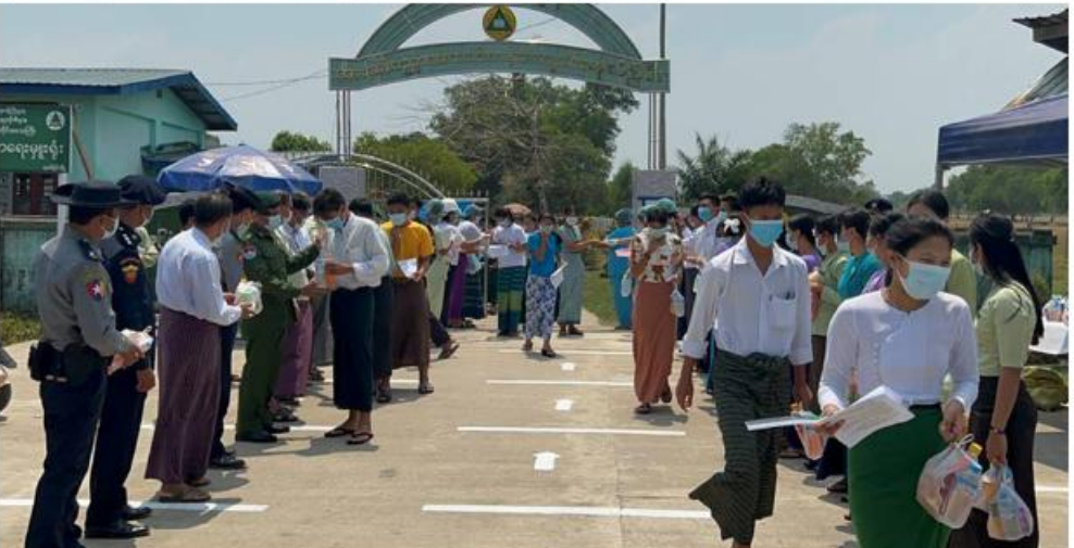
တိုင်းဒေသကြီးနှင့် ပြည်နယ်အသီးသီး၌ ၂၀၂၂-၂၀၂၃ ပညာသင်နှစ် တက္ကသိုလ်ဝင်စာမေးပွဲ ဒုတိယနေ့တွင် ကျောင်းသား၊ ကျောင်းသူများ အင်္ဂလိပ်စာဘာသာရပ်ဖြေဆိုနေမှုကို တွေ့ရစဉ်။