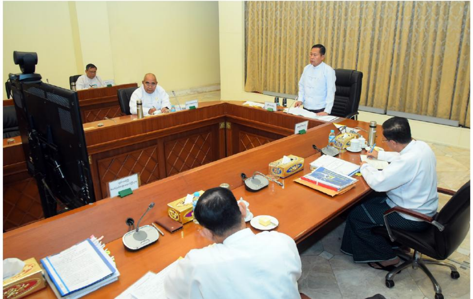
ဘဏ္ဍာရေးဆိုင်ရာကော်မရှင်ဒုတိယဥက္ကဋ္ဌ နိုင်ငံတော်စီမံအုပ်ချုပ်ရေးကောင်စီဒုတိယဥက္ကဋ္ဌ ဒုတိယဝန်ကြီးချုပ် ဒုတိယဗိုလ်ချုပ်မှူးကြီးစိုးဝင်း ၂၀၂၃-၂၀၂၄ ဘဏ္ဍာနှစ် ပြည်ထောင်စု၏ အရအသုံးခန့်မှန်းခြေငွေစာရင်းများတင်ပြခြင်းဆိုင်ရာ ညှိနှိုင်းအစည်းအဝေးတွင် အမှာစကားပြောကြားစဉ်။