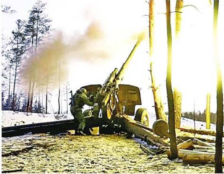
ရုရှားလေကြောင်းရန် ကာကွယ်ရေး စနစ်များသည် ယူကရိန်းတပ်မတော်၏ HIMARS MLRS ခုံးကျည်လေးစင်း နှင့် UAV ဒရုန်းငါးစင်းတို့ကို ပစ်ချနိုင်ခဲ့

လေကြောင်းရန်ကာကွယ်ရေးစနစ် များသည် Kherson ဒေသရှိ Nova-ya Kakhovka၊ Nikolaevka၊ Zaporozhye ဒေသရှိ Chervonoarmeyskoye၊ Donetsk ပြည်သူ့သမ္မတ နိုင်ငံရှိ Nikolskoye နှင့် Lugansk ပြည်သူ့သမ္မတနိုင်ငံရှိ Shipilovka အခြေချနေထိုင်ရာ ဒေသများအနီး HIMARS ခုံးကျည်လေးစင်းနှင့် UAV ဒရုန်း ငါးစင်းကို ပစ်ချဖျက်ဆီးနိုင်ခဲ့ကြောင်း ပြောကြားခဲ့သည်။ Konashenkov ၏အဆိုအရ အထူး စစ်ဆင်ရေးဆောင်ရွက်မှု စတင်ချိန်မှစ၍ လေယာဉ် ၃၉၈ စင်း၊ ရဟတ်ယာဉ် ၂၁၇ စင်း၊ ဒရုန်း ၃၃၆၀ စင်း၊ လေယာဉ်ပစ်ခုံးကျည်စနစ်အစီးရေ ၄၁၀၊ တင့်ကားနှင့် အခြားသံချပ်ကာတိုက်ခိုက် ရေးယာဉ် ၈၂၂၂ စီး၊ ခုံးကျည်မျိုးစုံ ပစ်လွှတ်မှုစနစ် တိုက်ခိုက်ရေးယာဉ် ၁၀၅၅ စီး၊ စစ်မြေပြင်သုံးအမြောက်နှင့်