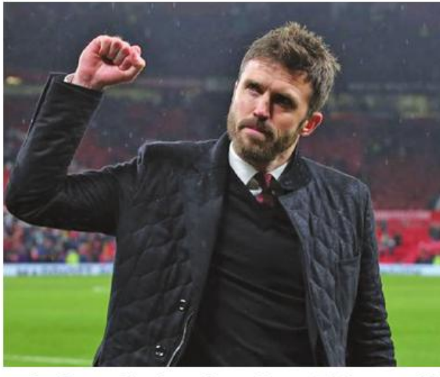
သော်လည်း လာမည့်ပွဲစဉ်များတွင် အခြေအနေကြောင့် နည်းပြ ရလဒ်များဆိုးရွားခဲ့ပါက တန်းဆင်း အပြောင်းအလဲ ပြုလုပ်လာဖွယ် ရန်အတွက် ကျရောက်မည် ရှိနေကြောင်း သိရသည်။ STA

သို့သော် အသင်းတာဝန်ရှိသူ များက နည်းပြမိုယက်စ်ကို ဆက် လက်စောင့်ကြည့်ရန် ဆုံးဖြတ်ခဲ့ကြ