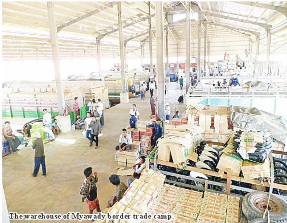
The warehouse of Myawady border trade camp.

Nay Pyi Taw March 9 The Ministry of Commerce on 3 February stated that Myawady trade zone handled more than US$1,800 million worth of trade value