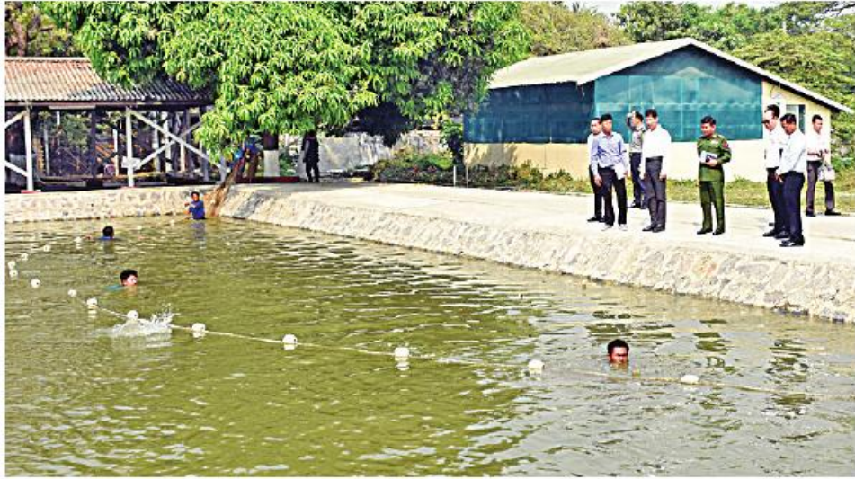
မန္တလေး မတ် ၉

ပုသိမ်ကြီးမြို့နယ် နန္ဒာတောင် ကျေးရွာရှိ နွေစပါးစိုက်တောင်သူများကို စိုက်ပျိုးရေးသွင်းအားစုပစ္စည်းများ ထောက်ပံ့ပေးအပ်ခြင်းအခမ်းအနားကို ယနေ့နံနက်ပိုင်းတွင် အဆိုပါကျေးရွာ၌ ကျင်းပရာ မန္တလေး တိုင်းဒေသကြီးဝန်ကြီးချုပ် ဦးမျိုးအောင်၊ တိုင်းဒေသကြီးဝန်ကြီးများ၊ တိုင်းဒေသကြီးအတွင်းရေးမှူးနှင့် တာဝန်ရှိသူများ၊ တိုင်းဒေသကြီးအဆင့် စိုက်ပျိုးရေးဦးစီးဌာန၊ ဆည်မြောင်းနှင့် ရေအသုံးချမှု စီမံခန့်ခွဲရေးဦးစီးဌာနတို့မှ ညွှန်ကြားရေးမှူးများနှင့် တာဝန်ရှိသူများ၊ ဒေသသံတောင်သူများ၊ ရပ်မိရပ်ဖများနှင့် ဖိတ်ကြားထားသူများ တက်ရောက်ကြသည်။