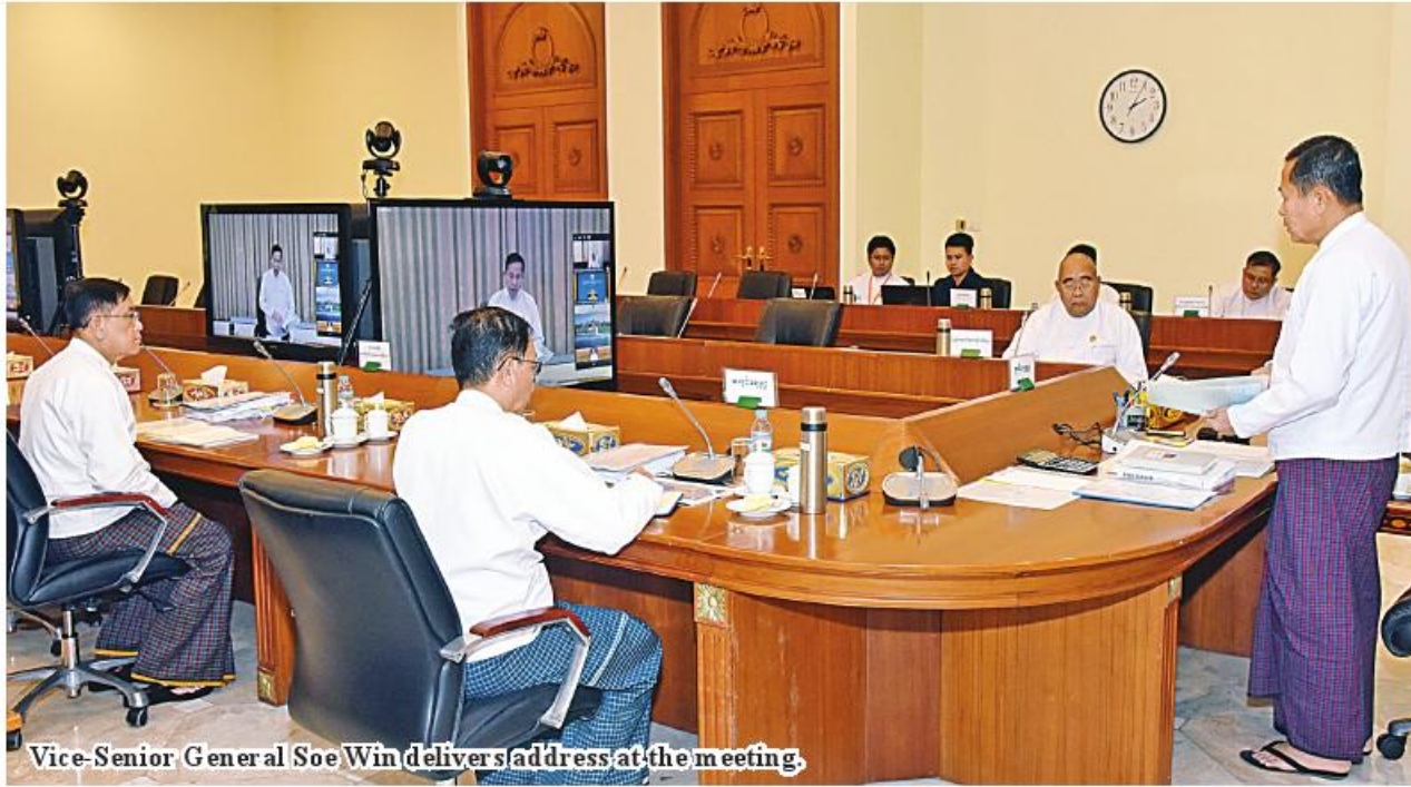
Vice-Senior General Soe Win delivers address at the meeting.