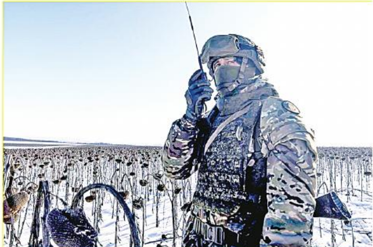
အဓိကနေရာအများအပြားကို သိမ်းပိုက် နိုင်ခဲ့ကြောင်း ပြောကြားခဲ့သည်။ Kiev troops to fight to the last for Artyomovsk, says Wagner PMC founder ကို ဘာသာပြန် ဆိုထားပါသည်။

အနီးကပ်စိုးမိုးထားနိုင်လျှင် ယခုကဲ့သို့ဖြစ် လာမည်မဟုတ်ကြောင်း ပြောကြားခဲ့သည်။ မတ် ၁ ရက်တွင် Prigozhin က ယူကရိန်းတပ်ဖွဲ့ဝင် ထောင်ပေါင်းများစွာ သည်Artyomovsk မြို့တွင် အပြင်းအထန် ခုခံတိုက်ခိုက်နေကြောင်း သတင်းပို့ခဲ့သည်။ Artyomovsk မြို့သည် Donetsk ပြည်သူ့သမ္မတနိုင်ငံ၏ ယူကရိန်းထိန်းချုပ် ရာ နယ်မြေအပိုင်းတွင် တည်ရှိပြီး Don- bass ဒေသတွင် ယူကရိန်းတပ်များကို ပံ့ပိုးရန်အတွက် အရေးကြီးသောသယ်ယူ ပို့ဆောင်ရေးအချက်အချာနေရာလည်းဖြစ် သည်။ မြို့အတွက် တိုက်ပွဲများ ပြင်းပြင်း ထန်ထန်ဖြစ်ပွားနေကြောင်း သိရသည်။ ဖေဖော်ဝါရီ ၁၆ ရက်က DPR ယာယီ ခေါင်းဆောင် Denis Pushilin က ရုရှား တပ်ဖွဲ့များသည် Artyomovsk မြို့အနီးရှိ