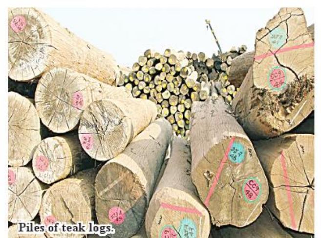
Piles of teak logs.

For further information, anyone may contact Myanmar Timber Enterprise (Head Office) and browse www.mte.com.mm and dial 01-372023, 372688, 02-4070371 and 01-377269. 336