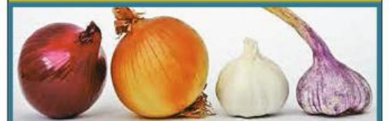
ကြက်သွန်ဖြူနှင့် ကြက်သွန်နီစားသုံးပေးခြင်းဖြင့် နှလုံးနှင့်အဆုတ်အတွက် အထူးကောင်းမွန်သည်။

ကိုဗစ်-၁၉ ရောဂါကူးစက်မှုကာကွယ်ရန် အထောက်အကူဖြစ်စေရန်