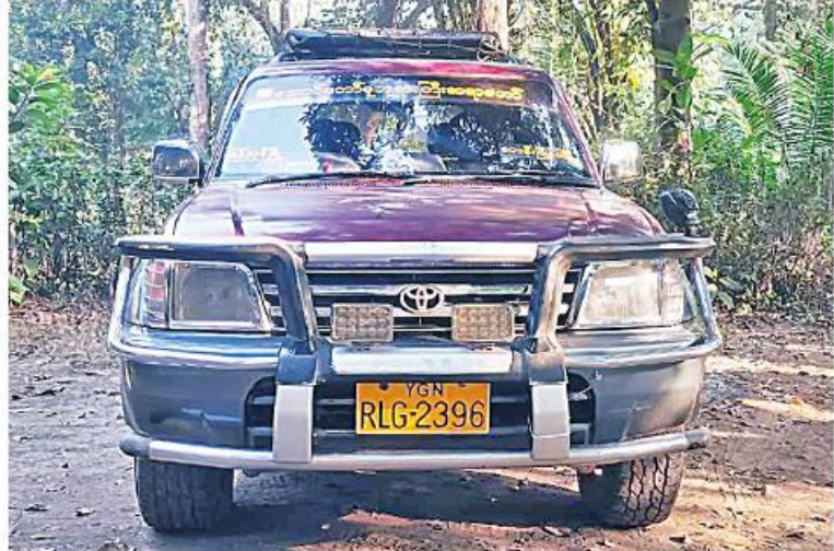
၂၀၂၃ ခုနှစ် ဖေဖော်ဝါရီ ၂၄ ရက်တွင် သထုံမြို့၊ ကော့ကရိတ်-သထုံကားလမ်း သထုံမြို့အထွက်ကားဂိတ်၌ ဖမ်းဆီးရမိခဲ့သည့် လက်နက်၊ ခဲယမ်းများတင်ဆောင်လာသော ပရောဂျိယာဉ်၏ မှတ်တမ်းဓာတ်ပုံ။

သေနတ် တစ်လက်၊ Glock ပစ္စုတံ ၁၀ လက်၊ Sigsauser ပစ္စုတံ သုံးလက်၊ ကျည်မျှင်စုံ အတောင့် ၃၉၈၀၊ ကျည်အိမ်မျိုးစုံ ၄၆ ခု၊ ရီမုခလုတ် ၄၉ ခုတို့နှင့်အတူ ဖမ်းဆီးရမိခဲ့သည်။ ဖြစ်စဉ်တွင် တရားခံ ကျားနှစ်ဦးနှင့် အတူ လက်နက်ငယ်မျိုးစုံ အလက် ၂၀၊ ကျည်မျှင်စုံ အတောင့် ၃၉၈၀၊ ကျည်အိမ်မျိုးစုံ ပေးမှုဖြင့် အကြမ်းဖက် CRPH နှင့် NUG မှ KNLA တပ်မဟာ(၆)ထံမှ ဝယ်ယူခဲ့သည့် လက်နက်၊ ခဲယမ်းများကို မကွေးတိုင်းဒေသကြီး မြိုင်မြို့နယ်နှင့် ပေါက်မြို့နယ်အတွင်း လှုပ်ရှားလျက်ရှိသည့် မြိုင် PDF အမည်ခံ အကြမ်းဖက်အဖွဲ့မှ ဖမ်းဆီးရန်ကျန်တရားခံ ရဲသော်တာ(ခ) ကျောက်တိုင်၊ ဗိုလ်လက်ျာနှင့် မြိုင်ကြီး