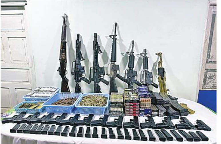
၂၀၂၃ ခုနှစ် ဖေဖော်ဝါရီ ၂၄ ရက်တွင် သထုံမြို့၊ ကော့ကရိတ်-သထုံကားလမ်း သထုံမြို့အထွက်ကားဂိတ်၌ သိမ်းဆည်းရမိခဲ့သည့် လက်နက်၊ ခဲယမ်းများ၏ မှတ်တမ်းဓာတ်ပုံ။

ကြောင်း၊ သတင်းပေးသူနှင့် ဖမ်းဆီးပေးသူများကို လျှို့ဝှက်၍ ဆူငွေများ ထိုက်တန်စွာ ချီးမြှင့်ပေးလျက်ရှိကြောင်းနှင့် မြို့ရွာများ အမြန်ဆုံး အေးချမ်းတည်ငြိမ်ရေးအတွက် ပြည်သူတစ်ရပ်လုံး ပူးပေါင်းပါဝင် ကြိုးပမ်းဆောင်ရွက်နိုင်ရန် မေတ္တာရပ်ခံ အပ်ပါကြောင်း အသိပေးသတင်းထုတ်ပြန် အပ်ပါသည်။