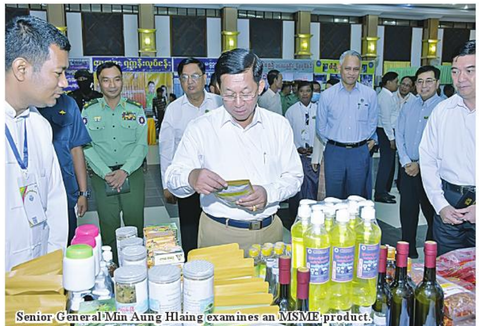
Senior General Min Aung Hlaing examines an MSME product.

eficial use of forest products in the state and prevention of forest depletion caused by exploitation, environmental conservation, application of modern methods in the salt businesses of Rakhine State and Ayeyawady Region to produce quality salt and reduce quality salt imports, means to contact relevant departments to attend technological courses for MSMEs,