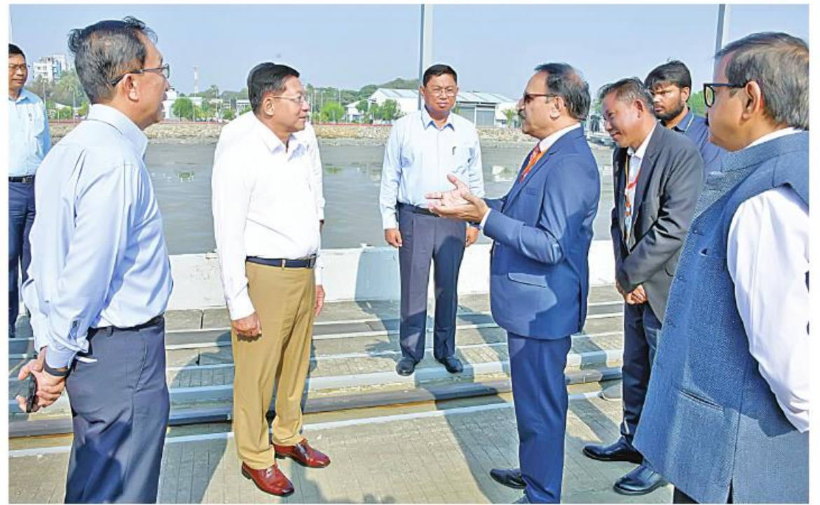
နိုင်ငံတော်စီမံအုပ်ချုပ်ရေးကောင်စီဥက္ကဋ္ဌ နိုင်ငံတော်ဝန်ကြီးချုပ် ဗိုလ်ချုပ်မှူးကြီးမင်းအောင်လှိုင်အား ကုလားတန်မြစ်ကြောင်း ဘက်စုံသုံး ဖြတ်သန်းသယ်ယူပို့ဆောင်ရေးစီမံကိန်းလုပ်ငန်းဆောင်ရွက်နေမှုအခြေအနေများနှင့်ပတ်သက်၍ စစ်တွေမြို့ဆိုင်ရာ အိန္ဒိယနိုင်ငံကောင်စစ်ဝန်ချုပ် Mr. Bibekananda Bhattamishra နှင့် တာဝန်ရှိသူများက ရှင်းလင်းတင်ပြစဉ်။

ချင်းကောင်း၊ မိတ်ဆွေကောင်းနိုင်ငံများ ဖြစ်ကြောင်း၊ ယခုစီမံကိန်းသည် နှစ်နိုင်ငံ ကူးလူးဆက်သွယ်မှု၊ ကုန်သွယ်မှုကို ပိုမို တိုးမြှင့်လာစေနိုင်မည်ဖြစ်ပြီး နှစ်နိုင်ငံလုံး အတွက် မဟာဗျူဟာအရ အရေးကြီးသည့် စီမံကိန်းတစ်ခုဖြစ်ကြောင်း၊ ရခိုင်ပြည်နယ် အတွင်း ပစ်ခတ်တိုက်ခိုက်မှုများရပ်စဲပြီး တည်ငြိမ်အေးချမ်းမှုရှိလာလျှင် ပလက်ဝ ဒေသအပါအဝင် ရခိုင်ပြည်နယ်မြောက်ပိုင်း ဒေသဖွံ့ဖြိုးရေးကို ဆောင်ရွက်နိုင်မည် ဖြစ်ကြောင်း၊ ထို့ပြင်ကုလားတန်မြစ်ကြောင်း တစ်လျှောက် ဖွံ့ဖြိုးတိုးတက်ရေးကိုလည်း များစွာ အထောက်အကူဖြစ်စေမည်ဖြစ် ကြောင်း၊ ထို့ကြောင့် စီမံကိန်းအမြန်ဆုံး အကောင်အထည်ဖော် ဆောင်ရွက်ပြီးစီး နိုင်ရေး သက်ဆိုင်ရာကဏ္ဍအလိုက် ကြိုးပမ်းဆောင်ရွက်ကြရန် လိုကြောင်းဖြင့် မှာကြားပြီး တက်ရောက်လာကြသူများနှင့် စီမံကိန်းဆိုင်ရာများကို အပြန်အလှန် ဆွေးနွေးသည်။ ထို့နောက် နိုင်ငံတော်စီမံအုပ်ချုပ်ရေး ကောင်စီဥက္ကဋ္ဌ နိုင်ငံတော်ဝန်ကြီးချုပ်နှင့် အဖွဲ့ဝင်များသည် ကုလားတန်မြစ်ကြောင်း ဘက်စုံသုံး ဖြတ်သန်းသယ်ယူပို့ဆောင်ရေး စီမံကိန်းလုပ်ငန်းခွင်အတွင်း လှည့်လည် ကြည့်ရှုရာ စစ်တွေမြို့ဆိုင်ရာ အိန္ဒိယနိုင်ငံ ကောင်စစ်ဝန်ချုပ် Mr. Bibekananda Bhattamishra နှင့် တာဝန်ရှိသူများက လုပ်ငန်းဆောင်ရွက်နေမှု အခြေအနေများ ကို ရှင်းလင်းတင်ပြသည်။ ရှင်းလင်းတင်ပြမှု