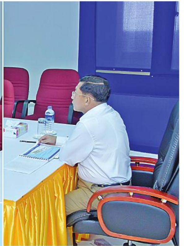
နိုင်ငံတော်စီမံအုပ်ချုပ်ရေးကောင်စီဥက္ကဋ္ဌ နိုင်ငံတော်ဝန်ကြီးချုပ် ဗိုလ်ချုပ်မှူးကြီးမင်းအောင်လှိုင်အား ပို့ဆောင်ရေးနှင့်ဆက်သွယ်ရေးဝန်ကြီးဌာန ပြည်ထောင်စုဝန်ကြီး ဗိုလ်ချုပ်ကြီးတင်အောင်စန်းက စီမံကိန်းဖြစ်ပေါ်လာသည့်အခြေအနေများနှင့် စီမံကိန်းတွင်ပါဝင်သည့် လုပ်ငန်းများနှင့်ပတ်သက်၍ ရှင်းလင်းတင်ပြစဉ်။

၂။ ရှေ့မှအဆက် ကုလားတန်ဆိပ်ခံတံတားဆိုင်ရာ အချက်အလက်များနှင့် တည်ဆောက်ပြီးစီးမှု အခြေအနေများ၊ ရုံးနှင့်ဆက်စပ် အဆောက်အအုံများ တည်ဆောက်ပြီးစီးမှု၊ စက်ယန္တရားများနှင့် မြစ်တွင်းသွား သယ်ယူပို့ဆောင်ရေးယာဉ်များ ရောက်ရှိမှု၊ ပလက်ဝ ပြည်တွင်းရေကြောင်းဆိပ်ကမ်း တည်ဆောက်ပြီးစီးမှု၊ ရေလမ်းကြောင်း သောင်တူးဖော်ခြင်းလုပ်ငန်းများ ဆောင်ရွက်ပြီးစီးမှု၊ ပလက်ဝမှ မြန်မာ-အိန္ဒိယ နယ်စပ်ထိ အဝေးပြေးကားလမ်း ဖောက်လုပ်ရန်ဆောင်ရွက်နေမှု၊ အပြည်ပြည်ဆိုင်ရာ အကောက်ခွန်ဆိပ်ကမ်းအဖြစ် သတ်မှတ်ဆောင်ရွက်ခြင်း၊ ပြည်တွင်း ဆိပ်ကမ်းအဖြစ် သတ်မှတ်ရန်ဆောင်ရွက် လျက်ရှိမှု၊ စီမံကိန်းပြီးစီးပါက ရရှိနိုင်မည့် အကျိုးကျေးဇူးများနှင့် ပတ်သက်၍ ရှင်းလင်းတင်ပြသည်။ ရှင်းလင်းတင်ပြမှုများနှင့် ပတ်သက်၍ နိုင်ငံတော်စီမံအုပ်ချုပ်ရေးကောင်စီဥက္ကဋ္ဌ နိုင်ငံတော်ဝန်ကြီးချုပ်က ကုလားတန် မြစ်ကြောင်း ဘက်စုံသုံး ဖြတ်သန်းသယ်ယူပို့ဆောင်ရေးစီမံကိန်းသည် ရခိုင်ပြည်နယ် အတွက် များစွာအကျိုးပြုစေမည် ဟု ယူဆကြောင်း ဖော်ပြခဲ့ပြီး ပြည်တွင်း၊ ပြည်ပကုန်စည်စီးဆင်းမှုများကို ပိုမို လျင်မြန်စေမည်ဖြစ်ကြောင်း၊ မြန်မာနိုင်ငံ နှင့် အိန္ဒိယနိုင်ငံသည် ကောင်းမွန်သည့် ဆက်ဆံရေးသမိုင်းကြောင်းရှိပြီး အိမ်နီး