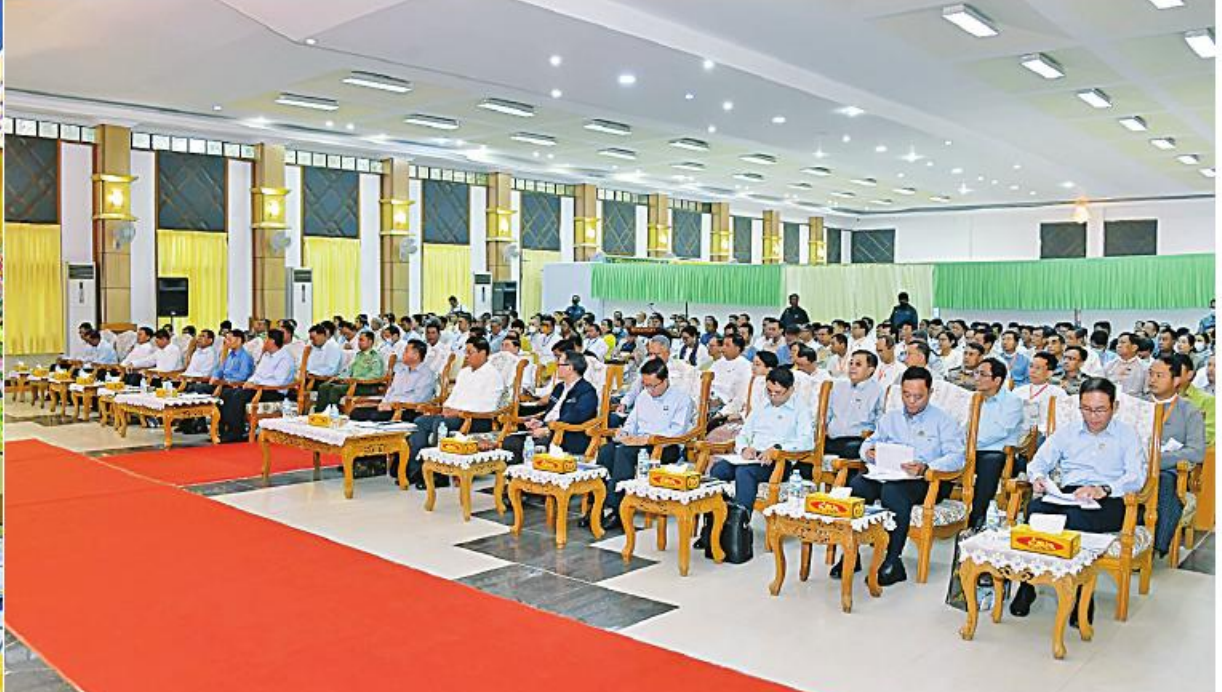
နိုင်ငံတော်စီမံအုပ်ချုပ်ရေးကောင်စီဥက္ကဋ္ဌ နိုင်ငံတော်ဝန်ကြီးချုပ် ဗိုလ်ချုပ်မှူးကြီးမင်းအောင်လှိုင် ရခိုင်ပြည်နယ်အတွင်းရှိ အသေးစား၊ အငယ်စားနှင့် အလတ်စားစီးပွားရေး (MSME) လုပ်ငန်းရှင်များအား တွေ့ဆုံ၍ ဒေသဖွံ့ဖြိုးတိုးတက်ရေးဆိုင်ရာများနှင့် စီးပွားရေးလုပ်ငန်းဖွံ့ဖြိုးတိုးတက်ရေးဆိုင်ရာများကို ဆွေးနွေးပြောကြားစဉ်။

နေပြည်တော် ဖေဖော်ဝါရီ ၂၇ နိုင်ငံတော်စီမံအုပ်ချုပ်ရေးကောင်စီ ဥက္ကဋ္ဌ နိုင်ငံတော်ဝန်ကြီးချုပ် ဗိုလ်ချုပ်မှူးကြီးမင်းအောင်လှိုင်သည် ယနေ့နံနက်ပိုင်းတွင် ရခိုင်ပြည်နယ်အတွင်းရှိ အသေးစား၊ အငယ်စားနှင့် အလတ်စားစီးပွားရေး (MSME) လုပ်ငန်းရှင်များအား စစ်တွေမြို့၊ ဦးဥက္ကမ ခန်းမ၌ တွေ့ဆုံ၍ ဒေသဖွံ့ဖြိုးတိုးတက်ရေးဆိုင်ရာများနှင့် စီးပွားရေးလုပ်ငန်းဖွံ့ဖြိုးတိုးတက်ရေးဆိုင်ရာများကို ဆွေးနွေးပြောကြားသည်။ ရခိုင်ပြည်နယ်အတွင်းရှိ အသေးစား၊ အငယ်စားနှင့် အလတ်စားစီးပွားရေး (MSME) လုပ်ငန်းရှင်များအား ပြည်ထောင်စုဝန်ကြီးများ၊ ရခိုင်ဒေါက်တာမူထန်၊ ပြည်ထောင်စုဝန်ကြီးများ၊ ရခိုင်ပြည်နယ်ဝန်ကြီးချုပ် ဦးထိန်လင်း၊ ကာကွယ်ရေးဦးစီးချုပ်ရုံးမှ စာမျက်နှာ ၁၆ ကော်လံ ၁ ☆