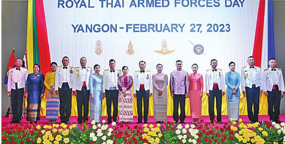
ထိုင်းဘုရင့်တပ်မတော်နေ့ အထိမ်းအမှတ်ညွှန်ပုံအခမ်းအနားတွင် ကာကွယ်ရေးဦးစီးချုပ် (ကြည်း)မှ ဒုတိယဗိုလ်ချုပ်ကြီး သက်ပုံ၊ မြန်မာနိုင်ငံဆိုင်ရာ ထိုင်းနိုင်ငံသံအမတ်ကြီး H.E. Mr. Mongkol Visitstumpi နှင့် အခမ်းအနားတက်ရောက်လာသူများ စုပေါင်းမှတ်တမ်းတင်ဓာတ်ပုံရိုက်ကြစဉ်။

သံအမတ်ကြီးက ကြိုဆိုနှုတ်ဆက် ဆက်လက်၍ စကားပြောကြားသည်။ ဆက်လက်၍ ထိုင်းဘုရင့်တပ်မတော်နေ့ အထိမ်းအမှတ် မှတ်တမ်း Video ကိုပြသပြီး သံအမတ်ကြီး၊ ဒုတိယဗိုလ်ချုပ်ကြီးသက်ပုံနှင့် စစ်သံမှူး တို့သည် ထိုင်းဘုရင့်တပ်မတော်နေ့အထိမ်း အမှတ်ကိတ်တို လုံးဖြတ်ပေးကြကာ အခမ်း အနားတက်ရောက်သူများနှင့်အတူ စုပေါင်း မှတ်တမ်းတင်ဓာတ်ပုံရိုက်ကြသည်။ ယင်းနောက် သံအမတ်ကြီးနှင့် ဝင်းဝင်း၊ စစ်သံမှူးတို့က အခမ်းအနားတက်ရောက် လာသူများကို ဂုဏ်ပြုညွှန်ပုံဖြင့် တည်ခင်း ညွှန်ပုံအခမ်းအနား သတင်းရရှိသည်။