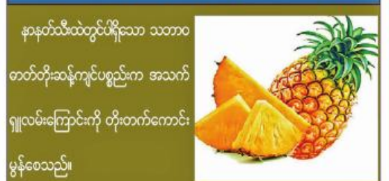
နာနတ်သီးထဲတွင်ပါရှိသော သဘာဝ တတ်တိုးဆန်ကျင်ပစ္စည်းက အသက်ရှူလမ်းကြောင်းကို တိုးတက်ကောင်းမွန်စေသည်။

ကိုဗစ်-၁၉ ရောဂါကူးစက်မှုကာကွယ်ရန် အထောက်အကူဖြစ်စေရန်