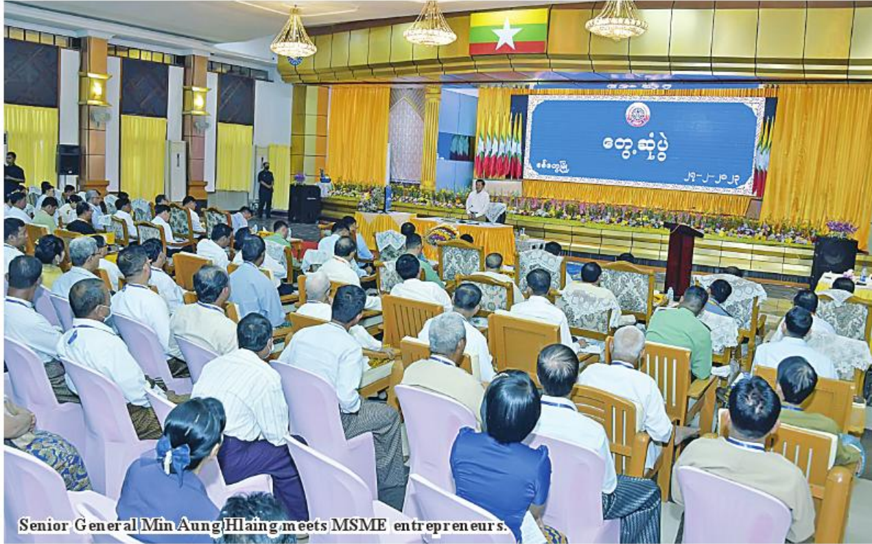
Senior General Min Aung Hlaing meets MSME entrepreneurs.

Nay Pyi Taw February 27 Chairman of State Administration Council Prime Minister Senior General Min Aung Hlaing met MSME entrepreneurs in Rakhine State at U Ottamma Hall in Sittway this morning and discussed regional and economic development.