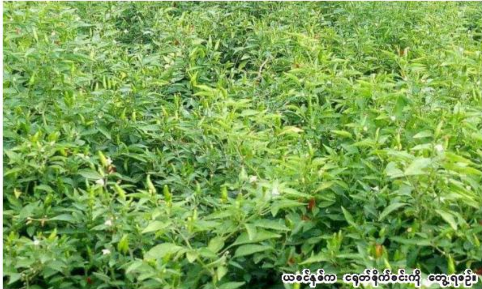
ယခင်နှစ်က ငရုတ်စိုက်ခင်းကို တွေ့ရစဉ်။

မုံရွာ ပေဖော်ဝါရီ ၂၇ စစ်ကိုင်းတိုင်းဒေသကြီးတွင် ဆောင်းသီးနှံ စိုက်ပျိုးရာသီ၌ ငရုတ်ကေ ၉၀၀၀ ကျော် စိုက်ပျိုးပြီးစီးပြီဖြစ်ကြောင်း စစ်ကိုင်းတိုင်းဒေသကြီး စိုက်ပျိုးရေးဦးစီးဌာနမှ တိုင်းဒေသကြီးဦးစီးမှူး ဦးဝင်းလှိုင် ဦးက ပြောပြ၍ သိရသည်။ စစ်ကိုင်းတိုင်းဒေသကြီးအတွင်း ဆောင်းသီးနှံ စိုက်ပျိုးရာသီ၌ ငရုတ်စိုက်ပျိုးမှုအနေဖြင့် ၂၀၂၂