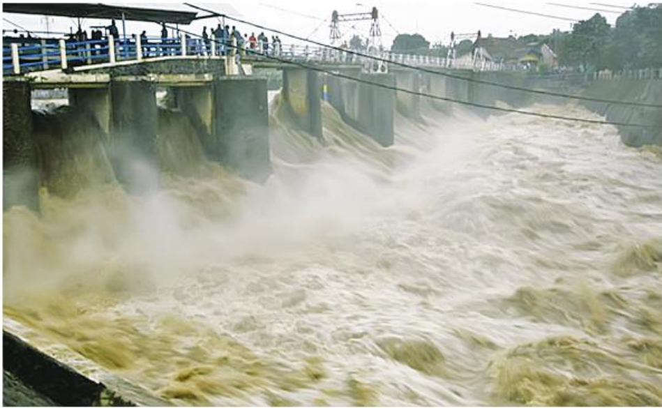
ဂျကာတာ ဖေဖော်ဝါရီ ၂၇

အင်ဒိုနီးရှားနိုင်ငံ အနောက် ဂျကာတာကျွန်း ဘိုဂေါမြို့ရှိ ကတ္တလမ်ပါရေတံခါး၌ ရေပမာဏမြင့်တက်မှုကြောင့် ဘိုဂေါမြို့အပါအဝင် ဂျကာတာမြို့နှင့် ပန်ကက်ခါမြို့တို့ကို