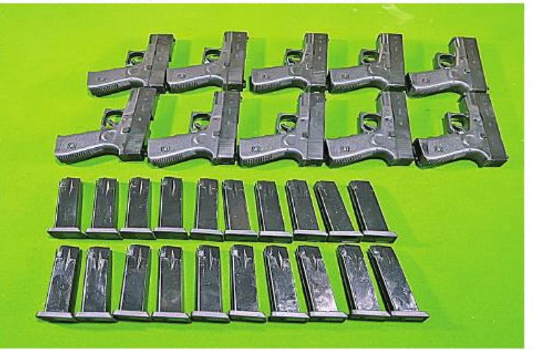
၂၀၂၃ ခုနှစ် ဖေဖော်ဝါရီ ၂၄ ရက်တွင် သထုံမြို့၊ ကော့ကရိတ်-သထုံကားလမ်း သထုံမြို့အထွက်ကားဂိတ်၌ သိမ်းဆည်းရမိခဲ့သည့် လက်နက်၊ ခဲယမ်းများ၏ မှတ်တမ်းဓာတ်ပုံ။

(ခ)ယက္ခတို့ထံသို့ အခကြေးငွေရယူ၍ ပို့ဆောင်ပေးခဲ့ကြောင်း ဖော်ထုတ်သိရှိရသည်။ ဖမ်းဆီးရမိတရားခံများ၏ ထွက်ဆိုချက်အရ လက်နက်၊ ခဲယမ်းများအား မွေရာ၊ မြက်ဖျာများ၊ အဝတ်အစားဘေထုပ်အိတ်များနှင့် မုန့်ပွဲများအတွင်း၌ ထည့်သွင်းသို့ဝှက်၍ ခရီးသည်တင်ကားများဖြင့် ပို့ဆောင်ခြင်း၊ လိုင်စင်မဲ့မော်တော်ယာဉ်များကို သာသနာပိုင်ယာဉ်၊ လူမှုကယ်ဆယ်ရေးယာဉ် နံပါတ်ပြားများတပ်ဆင်၍ ပုံမှားရိုက်ခရီးသွားဟန်လွဲ ပြုလုပ်ပို့ဆောင်သိရှိရသည်။ သို့ဖြစ်ပါ၍ ဖမ်းဆီးရမိတရားခံများကို ဥပဒေအရ ထိရောက်စွာအရေးယူနိုင်ရေး ဆက်လက်ဆောင်ရွက်သွားမည် ဖြစ်ကြောင်း၊ အကြမ်းဖက်မှုလုပ်ငန်း ဆောင်ရွက်နေသူများကို ပြည်သူ့တစ်ရပ်လုံးက ပိုင်းဝန်းကာကွယ်တိုက်ဖျက်ကြရန်နှင့် ဆက်စပ်တရားခံများအား အမြန်ဆုံး ဆက်လက်ဖမ်းဆီးရမိရေးအတွက် ၎င်းတို့ ပုန်းခိုရာနေရာများ၊ လှုပ်ရှားသွားလာနေထိုင်မှုသတင်းများရရှိပါက သက်ဆိုင်ရာ သို့ လျှို့ဝှက်စွာ သတင်းပေးတိုင်ကြားနိုင်