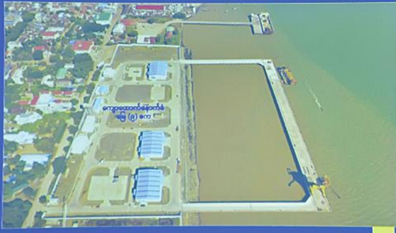
Senior General Min Aung Hlaing hears a report on Kaladan Multi-Modal Transit Transport Project.

အလျား ၂၇၃ မီတာ x အကျယ် ၁၅၂ မီတာအရွယ်ရှိ ပင်မဆိပ်ခံတံတားနှင့် အလျား ၁၃၆ မီတာ x အကျယ် ၉၅ မီတာအရွယ် ချွင်းကပ်တံတား (၂)စင်းပါဝင်သော စစ်တွေဆိပ်ကမ်း တည်ဆောက်ခြင်း၊ ဆိပ်ကမ်းဝင်းအတွင်း ရုံးအဆောက်အဦများ တည်ဆောက်ခြင်း လုပ်ငန်းများအား ၂၀၁၀ ခုနှစ်တွင် စတင်တည်ဆောက်ခဲ့ပြီး ၂၀၁၆ ခုနှစ်တွင် ဆောင်ရွက်ပြီးစီးခဲ့ပါသည်။