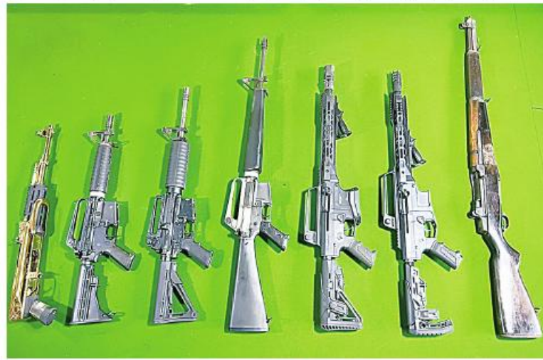
၂၀၂၃ ခုနှစ် ဖေဖော်ဝါရီ ၂၄ ရက်တွင် သထုံမြို့၊ ကော့ကရိတ်-သထုံကားလမ်း သထုံမြို့အထွက်ကားဂိတ်၌ သိမ်းဆည်းရမိခဲ့သည့် လက်နက်၊ ခဲယမ်းများ၏ မှတ်တမ်းဓာတ်ပုံ။

နေပြည်တော် ဖေဖော်ဝါရီ ၂၃ နိုင်ငံတော်အစိုးရက အကြမ်းဖက် အုပ်စုအဖြစ်ကြေညာထားသည့် CRPH၊ NUG နှင့် PDF အမည်ခံ အကြမ်းဖက် အုပ်စုများသည် ပြည်သူ့အတွက်ဟုသုံးနှုန်း၍ ရဟန်းသံဃာများ၊ ဆရာ၊ ဆရာမများ အပါအဝင် နိုင်ငံ့ဝန်ထမ်းများနှင့် အပြစ်မဲ့ ပြည်သူများကို သတ်ဖြတ်ခြင်း၊ လူယက်ခြင်း များအား ဥပဒေမဲ့ ကျူးလွန်လျက်ရှိသည်။ ထို့ပြင် CRPH နှင့် NUG တို့သည် တိုင်းရင်းသားလက်နက်ကိုင်အဖွဲ့အချို့နှင့် ချိတ်ဆက်၍ လက်နက်ခဲယမ်းများ ဝယ်ယူကာ PDF အမည်ခံ အကြမ်းဖက်သမားများကိုထောက်ပံ့၍ အပြစ်မဲ့ပြည်သူများအပေါ် မြိမ်းခြောက်ခြင်း၊ လူသတ်ခြင်းနှင့် အဖျက်အမှောင့်လုပ်ငန်းများ လုပ်ဆောင်ခြင်းတို့ကို ဆောင်ရွက်လျက်ရှိသည်။