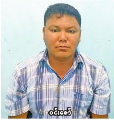
ဝင်းဇော်