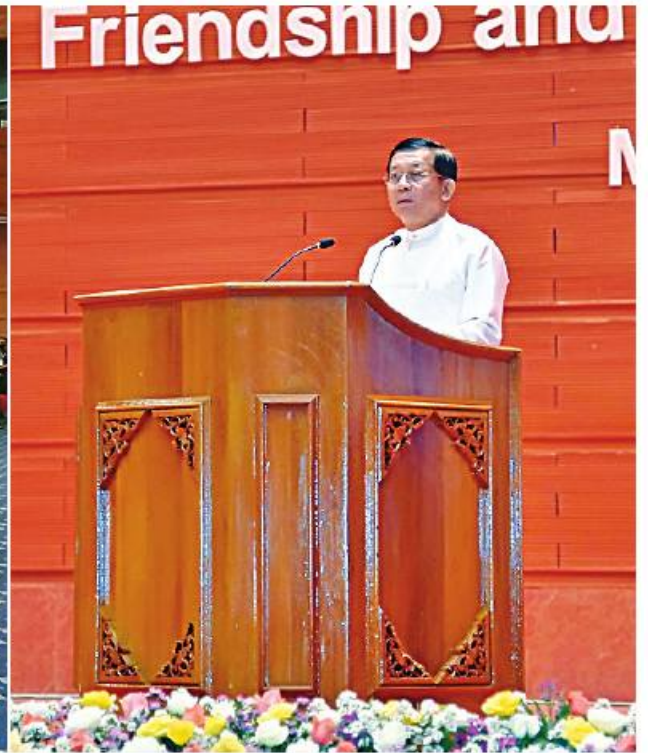
နိုင်ငံတော်စီမံအုပ်ချုပ်ရေးကောင်စီဥက္ကဋ္ဌ နိုင်ငံတော်ဝန်ကြီးချုပ် ဗိုလ်ချုပ်မှူးကြီးမင်းအောင်လှိုင် (၇၅)နှစ်မြောက် မြန်မာ-ရုရှား သံတမန်ဆက်သွယ်ထူထောင်မှုအထိမ်းအမှတ်အဖြစ် မြန်မာ-ရုရှား ချစ်ကြည်ရေးနှင့် ပူးပေါင်းဆောင်ရွက်ရေးဖိုရမ်တွင် အမှာစကားပြောကြားစဉ်။