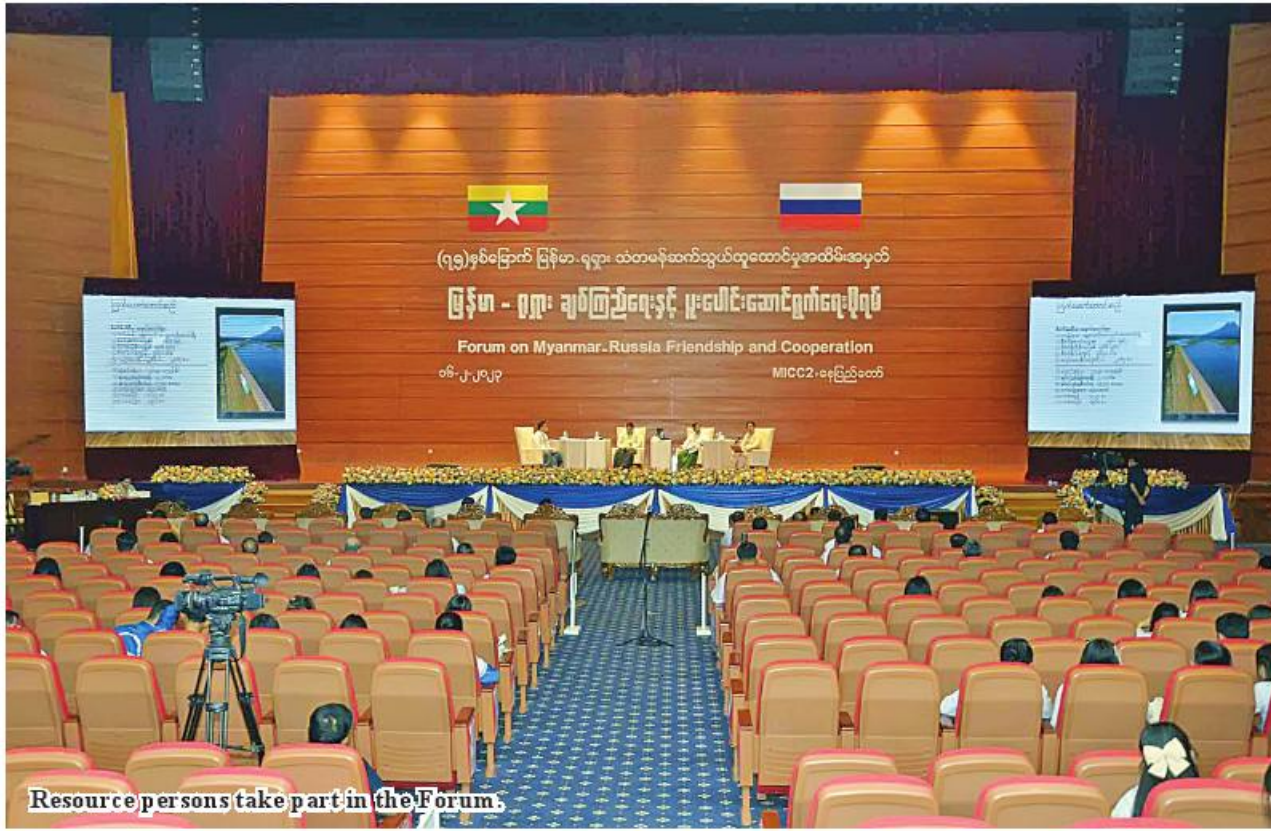
Resource persons take part in the Forum.

From Page 11 regained independence in 1948. So, there is a firm bilateral friendship between them.