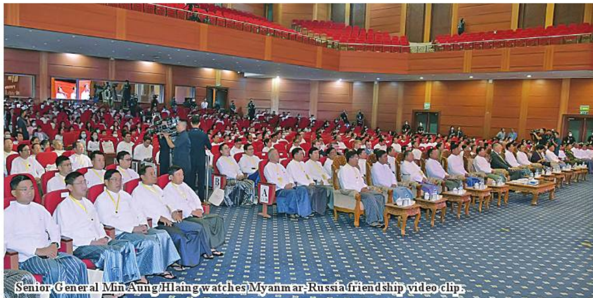
Senior General Min Aung Hlaing watches Myanmar-Russia friendship video clip.