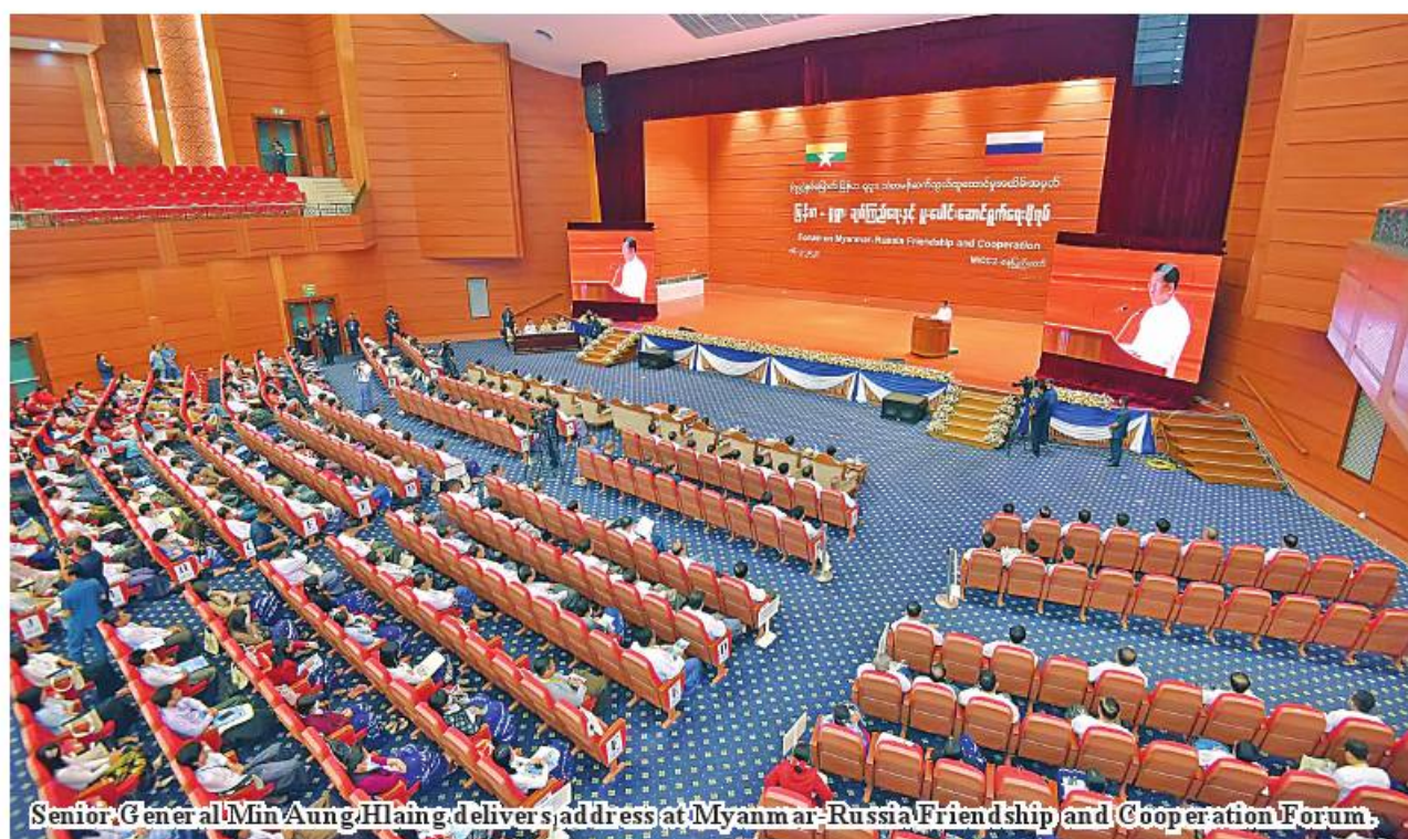
Senior General Min Aung Hlaing delivers address at Myanmar-Russia Friendship and Cooperation Forum.

friendship throughout the successive eras was shown.