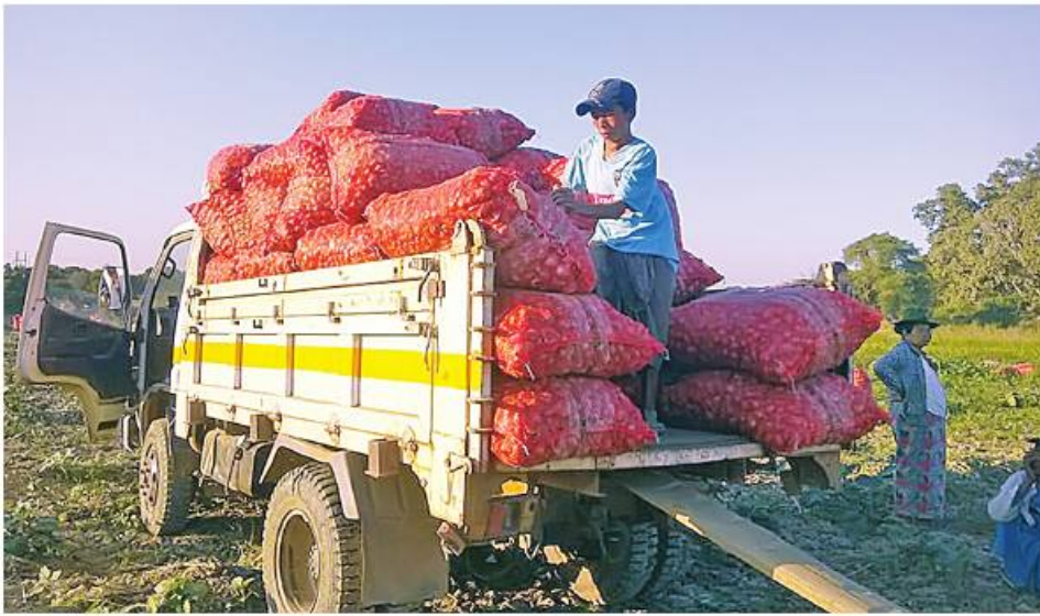
နေပြည်တော်၊ ဖေဖော်ဝါရီ ၁၆

မြန်မာ့ကြက်သွန်နီကဏ္ဍ စဉ်ဆက်မပြတ် ဖွံ့ဖြိုးတိုးတက်ရေးအတွက် ဖိလစ်ပိုင်နိုင်ငံအပါအဝင် ဈေးကွက်အလားအလာရှိသည့် နိုင်ငံများသို့ အစိုးရချင်းချိတ်ဆက်သည့် G to G စနစ်ဖြင့် တိုးမြှင့်