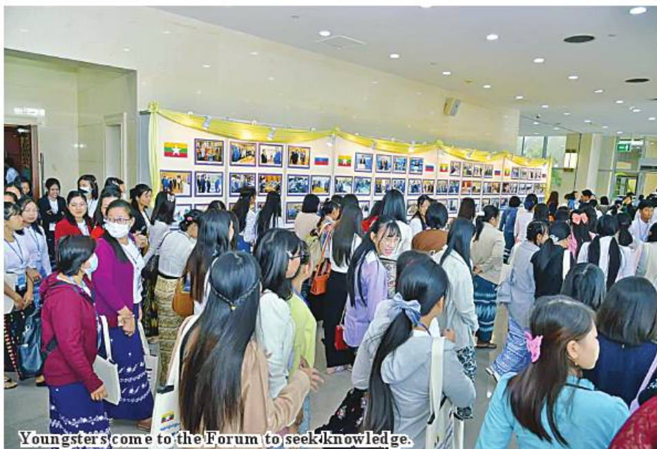
Youngsters come to the Forum to seek knowledge.

In so doing, it is necessary to seek the ways which can be practically used for serving interests of the entire people. As Myanmar is blessed with the good opportunities, encouragements must be given to improvement of domestic businesses and manufacturing. As human resource is playing a key role in this measure,