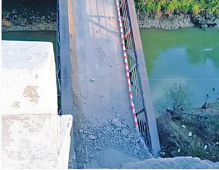
ကြာအင်းဆိပ်ကြီးမြို့နယ် သံပုကျေးရွာအနီး ကြာအင်းဆိပ်ကြီး-ချောင်းနှစ်ခွလမ်းရှိ ဒါလီချောင်းကူးတံတားကို အကြမ်းပက်မှုကိုလိုလားသည့် အကြမ်းပက်အဖွဲ့နှင့် PDF အမည်ခံ အကြမ်းပက်သမားများက မိုင်းထောင်ဖောက်ခွဲဖျက်ဆီးထားမှုကို တွေ့ရစဉ်

နေပြည်တော် ဖေဖော်ဝါရီ ၁၆ ကရင်ပြည်နယ် ကြာအင်းဆိပ်ကြီးမြို့နယ် သံပုကျေးရွာအနီး ကြာအင်းဆိပ်ကြီး-ချောင်းနှစ်ခွလမ်းရှိ ဒါလီချောင်းကူးတံတား