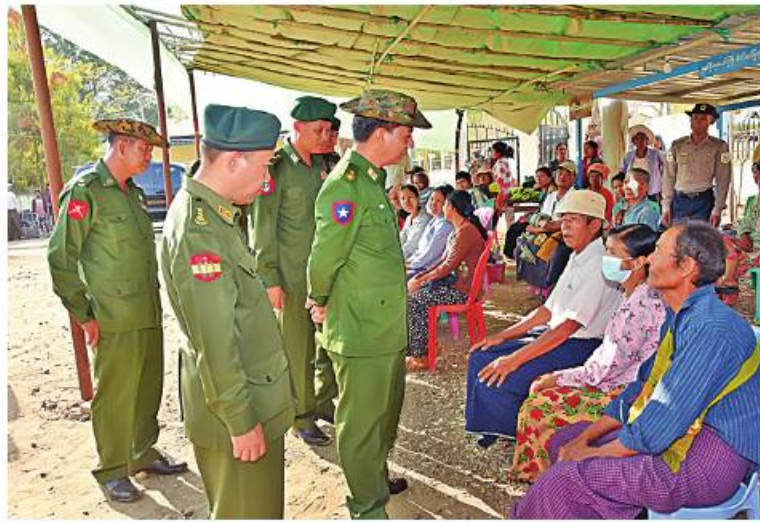
အလယ်ပိုင်းတိုင်းစစ်ဌာနချုပ် တိုင်းမှူး ဗိုလ်ချုပ်ကိုကိုဦး ဒေသခံပြည်သူများအား ကျန်းမာရေးစောင့်ရှောက်မှုလုပ်ငန်းများ ဆောင်ရွက်ပေးနေမှုကို ကြည့်ရှုအားပေးစဉ်။

နေပြည်တော် ဖေဖော်ဝါရီ ၁၆ မကွေးတိုင်းဒေသကြီးအတွင်း ရောက်ရှိနေသည့် တပ်မတော်နယ်လှည့်အထူးဆေးကုသရေးအဖွဲ့သည် ယနေ့တွင် မကွေးမြို့နယ် မိကျောင်းရဲကျေးရွာရှိ တိုက်နယ်ဆေးရုံ၌ အခြေပြု၍ အဆိုပါ ကျေးရွာနှင့် ပတ်ဝန်းကျင်ကျေးရွာများမှ ဒေသခံပြည်သူ စုစုပေါင်း ၈၀၆ ဦးကို ကျန်းမာရေးစောင့်ရှောက်မှုလုပ်ငန်းများ ဆက်လက်ဆောင်ရွက်ပေးသည်။ ထိုသို့ ဆောင်ရွက်ပေးရာတွင် ဆေးကုသမှုဆိုင်ရာရောဂါ ဦးရေ ၂၃၀၊ ခွဲစိတ်ရောဂါ ၇၆ ဦး၊ ကလေးရောဂါ ၅၅ ဦး၊ သားပွားမီးယပ်ရောဂါဦးရေ ၃၀၊ အရိုးရောဂါ ၁၄၃ ဦး၊ နား၊ နှာခေါင်း၊ လည်ချောင်းရောဂါဦးရေ ၃၀၊ မျက်စိ