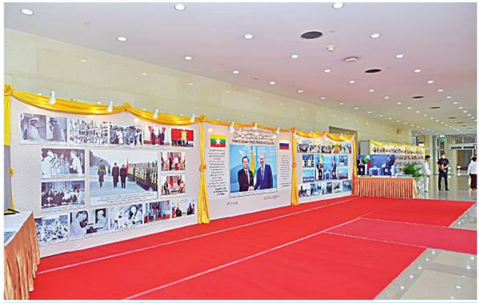
(၇၅)နှစ်မြောက် မြန်မာ-ရုရှား သံတမန်ဆက်သွယ်ထူထောင်မှုအထိမ်းအမှတ်အဖြစ် မြန်မာ-ရုရှား ချစ်ကြည်ရေးနှင့်ပူးပေါင်းဆောင်ရွက်ရေးဗိုရစ်တွင် ခင်းကျင်းပြသထားသည့် မှတ်တမ်းဓာတ်ပုံများကိုတွေ့ရစဉ်။