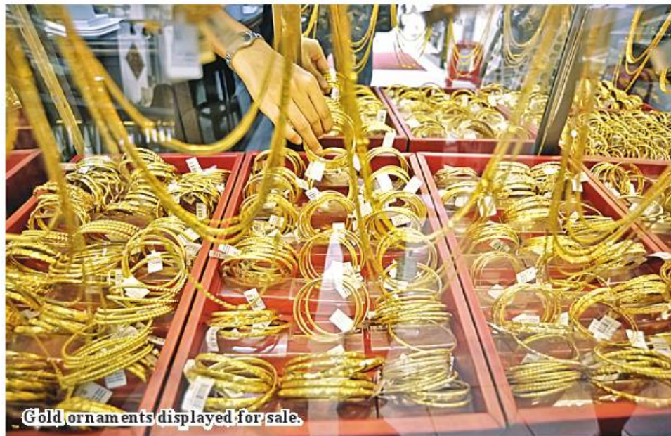
Gold ornaments displayed for sale.