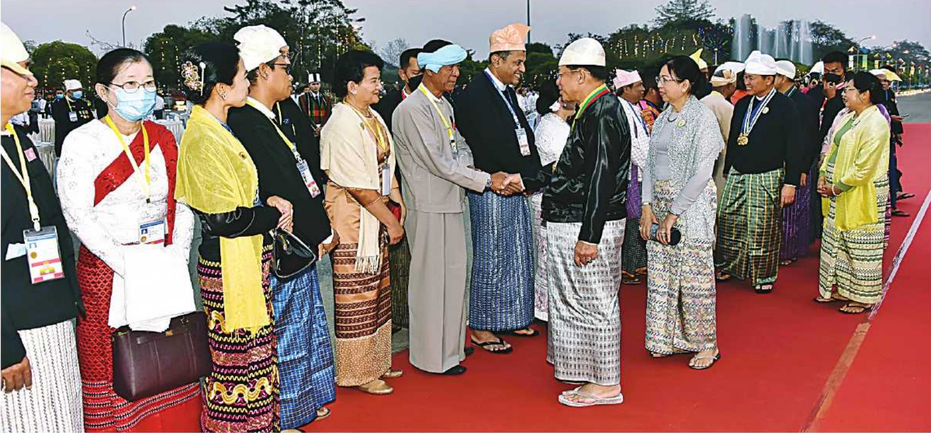
နိုင်ငံတော်စီမံအုပ်ချုပ်ရေးကောင်စီဥက္ကဋ္ဌ နိုင်ငံတော်ဝန်ကြီးချုပ် ဝိုလ်ချုပ်မှူးကြီး သတိုးမဟာသရေစည်သူ သတိုးသီရိသုဓမ္မမင်းအောင်လှိုင်နှင့် ဇနီး ဒေါ်ကြူကြူလှတို့ (၇၆)နှစ်မြောက် ပြည်ထောင်စုနေ့အထိမ်းအမှတ် ဂုဏ်ပြုညစာစားပွဲသို့ တက်ရောက်လာကြသူများကို ရင်းရင်းနှီးနှီးနှုတ်ဆက်စဉ်။

နေပြည်တော် ဖေဖော်ဝါရီ ၁၂ ၊ ဝိုလ်ချုပ်မှူးကြီး သတိုးမဟာသရေစည်သူ သတိုးသီရိ သုဓမ္မမင်းအောင်လှိုင်နှင့် ဇနီး ဒေါ်ကြူကြူလှတို့က ပြည်ထောင်စုနေ့အထိမ်းအမှတ် ဂုဏ်ပြုညစာစားပွဲ နိုင်ငံတော်စီမံအုပ်ချုပ်ရေးကောင်စီ ဥက္ကဋ္ဌ ပြည်ထောင်စုသမ္မတမြန်မာနိုင်ငံတော် နိုင်ငံတော် သုဓမ္မမင်းအောင်လှိုင်နှင့် ဇနီး ဒေါ်ကြူကြူလှတို့က အခမ်းအနားကို ယနေ့ညပိုင်းတွင် နေပြည်တော်ရှိ နိုင်ငံတော်ဝန်ကြီးချုပ် တည်ခင်းညွှန်သည့် ၂၀၂၃ ခုနှစ် (၇၆)နှစ်မြောက် မြို့တော်ခန်းမ ဥပစာရင်ပြင်၌ ကျင်းပသည်။