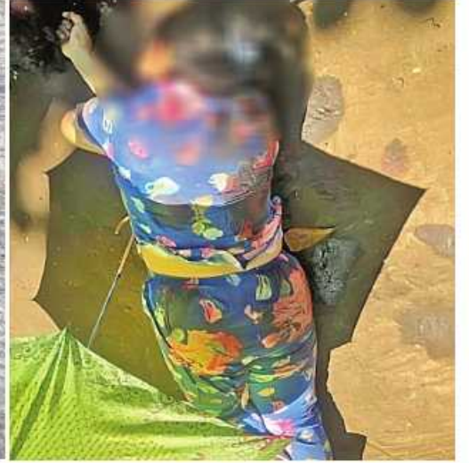
၂၀၂၂ ခုနှစ် အောက်တိုဘာ ၂၀ ရက်တွင် လှိုင်မြို့နယ် အမှတ်(၁၃)ရပ်ကွက် ဗဟိုလမ်းထောင့်နှင့် ပေါင်းစည်းလမ်းထောင့်၌ လုံခြုံရေးတပ်ဖွဲ့ဝင် နှစ်ဦးနှင့် အပြစ်မဲ့ပြည်သူတစ်ဦးတို့ကို အကြမ်းဖက်သမားများက သေနတ်ဖြင့် ပစ်ခတ်လုပ်ကြံသတ်ဖြတ်ခဲ့သည့် မှတ်တမ်းဓာတ်ပုံ။