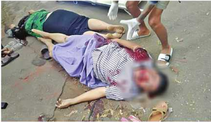
၂၀၂၃ ခုနှစ် ဇန်နဝါရီ ၂၅ ရက်တွင် မရမ်းကုန်းမြို့နယ် ဘုရင့်နောင် (၁) ရပ်ကွက် တပင်ရွှေထီးလမ်းနှင့် အမှတ်(၂)လမ်းထောင့်၌ စစ်မှုထမ်းဟောင်း တစ်ဦးနှင့် အပြစ်မဲ့ပြည်သူတစ်ဦးကို အကြမ်းဖက်သမားများက သေနတ်ဖြင့် ပစ်ခတ်လုပ်ကြံသတ်ဖြတ်ခဲ့သည့် မှတ်တမ်းဓာတ်ပုံ။