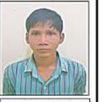
ညီညီထွေး(ခ)သဲဖောင်း (အကြမ်းဖက်အဖွဲ့ဝင်၊ လုပ်ကြံသတ်ဖြတ်သူ)