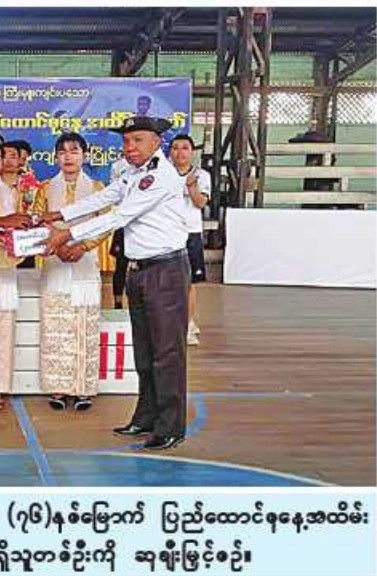
မွန်ပြည်နယ် ကျိုက်မရောမြို့နယ်၌ (၇၆)နှစ်မြောက် ပြည်ထောင်စုနေ့အထိမ်း အမှတ် လက်ကမ်းစာစောင်များကို အစဉ်ပြန်ပေးစဉ်။