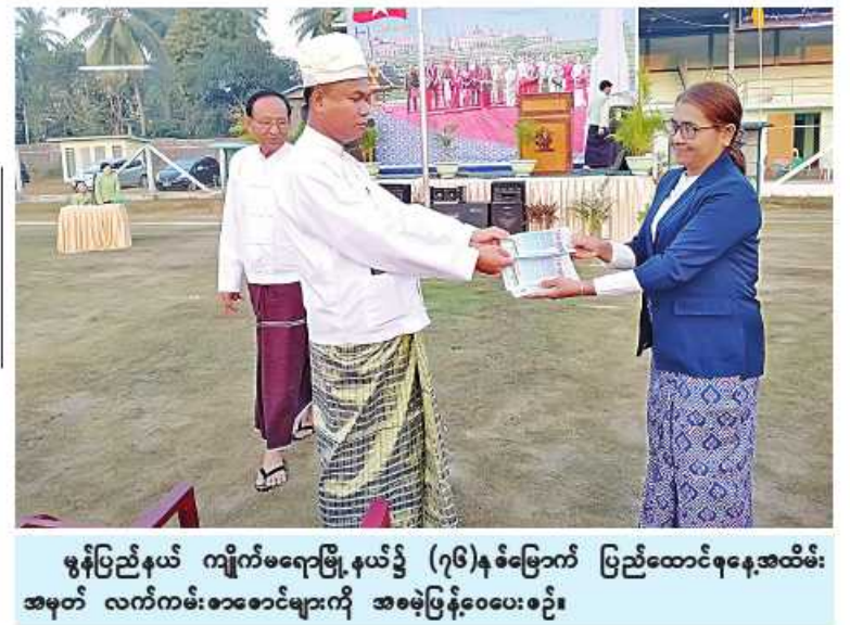
မွန်ပြည်နယ် ကျိုက်မရောမြို့နယ်၌ (၇၆)နှစ်မြောက် ပြည်ထောင်စုနေ့အထိမ်း အမှတ် လက်ကမ်းစာစောင်များကို အစဉ်ပြန်ပေးစဉ်။