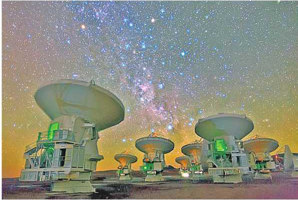
ရောမ ဖေဖော်ဝါရီ ၁၂

ကမ္ဘာကျော် ရူပဗေဒပညာရှင်ကြီး အဲလ်ဘတ်အိုင်စတိုင်း၏ (ယေဘုယျနှိုင်းရသီအိုရီ)ကို အသုံးပြု၍ မြင်တွေ့ရန်ခက်ခဲသည့် ကိုယ်ပျောက်ကြယ်စုတစ်ခုကို သိပ္ပံပညာ