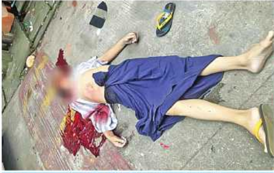
၂၀၂၂ ခုနှစ် စက်တင်ဘာ ၁၇ ရက်တွင် လှိုင်မြို့နယ် အမှတ်(၁၃)ရပ်ကွက် ရတနာလမ်း၌ ရာအိမ်မှူးတစ်ဦးကို အကြမ်းဖက်သမားများက သေနတ်ဖြင့် ပစ်ခတ်လုပ်ကြံသတ်ဖြတ်ခဲ့သည့် မှတ်တမ်းဓာတ်ပုံ။