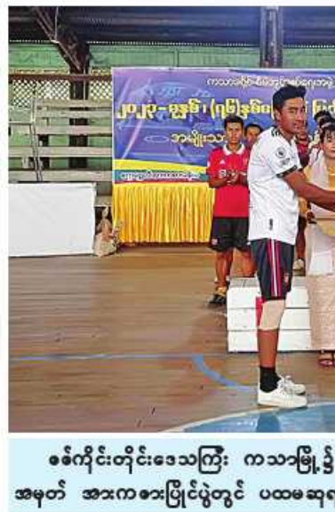
စစ်ကိုင်းတိုင်းဒေသကြီး ကသာမြို့၌ (၇၆)နှစ်မြောက် ပြည်ထောင်စုနေ့အထိမ်း အမှတ် အားကစားပြိုင်ပွဲတွင် ပထမဆုရရှိသူတစ်ဦးကို ဆုချီးမြှင့်စဉ်။

ဌာနချုပ်အသီးသီးမှ တိုင်းမှူးများနှင့် တာဝန်ရှိသူများ၊ ပြည်နယ်အဆင့် ဌာန ဆိုင်ရာတာဝန်ရှိသူများ၊ လူမှုရေးအသင်း အဖွဲ့များ၊ ကျောင်းသား၊ ကျောင်းသူများ နှင့် ဒေသခံပြည်သူများ တက်ရောက် ကြသည်။