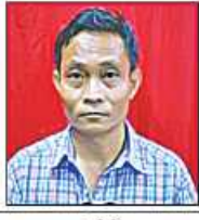
ချစ်ကို (လုပ်ကြံသတ်ဖြတ်ရန် သတင်းပေးသူ)