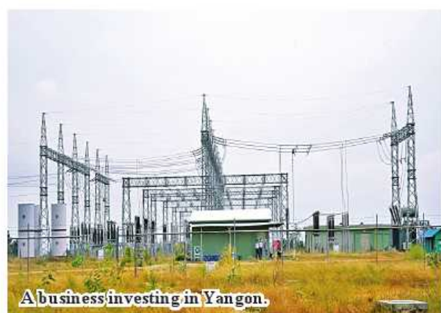
A business investing in Yangon.