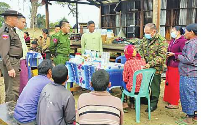
အနောက်မြောက်တိုင်းစစ်ဌာနချုပ် နယ်မြေခံဆေးကုသရေးအဖွဲ့က ဒေသခံပြည်သူ များကို ကျန်းမာရေးစောင့်ရှောက်မှုလုပ်ငန်းများ ဆောင်ရွက်ပေးစဉ်။

ဆောင်ရွက်ပေးပြီး ECG နှင့် အမ်စရာ ဆောင်းစက်တို့ဖြင့် ရောဂါရှာဖွေ စမ်းသပ် ကုသပေးခြင်းများ ဆောင်ရွက်ပေးခဲ့သည်။ အလားတူ စစ်ကိုင်းတိုင်းဒေသကြီး နာဂကိုယ်ပိုင်အုပ်ချုပ်ခွင့်ရဒေသ လဟယ် မြို့ ယွန်းတိုင်းကျေးရွာရှိ ဒေသခံပြည်သူ များနှင့် ဌာနဆိုင်ရာဝန်ထမ်းများ စုစုပေါင်း ၆၂ ဦးကို ဖေဖော်ဝါရီ ၁၁ ရက်တွင် အနောက်မြောက်တိုင်း စစ်ဌာနချုပ် နယ်မြေခံဆေးကုသရေးအဖွဲ့က အဆိုပါ ကျေးရွာရှိစာသင်ကျောင်း၌ ဆီးချိုရောဂါ၊ သွေးတိုးရောဂါ၊ အထွေထွေရောဂါတို့နှင့် ပတ်သက်၍ လိုအပ်သည့် ဆေးဝါးကုသ မှုများ ဆောင်ရွက်ပေးခဲ့ကြောင်း သတင်းရရှိသည်။