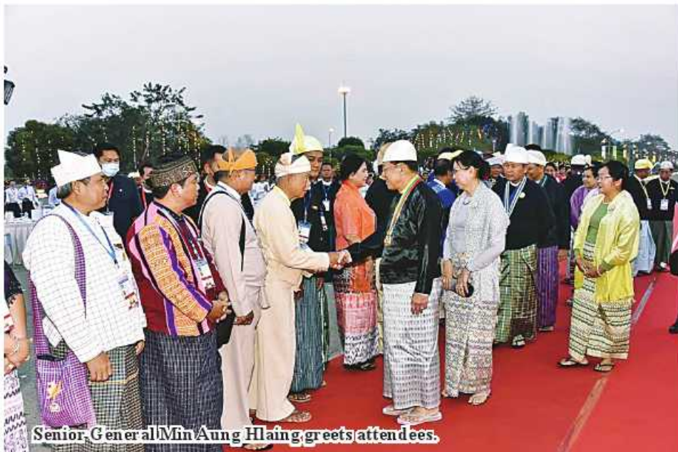
Senior General Min Aung Hlaing greets attendees.