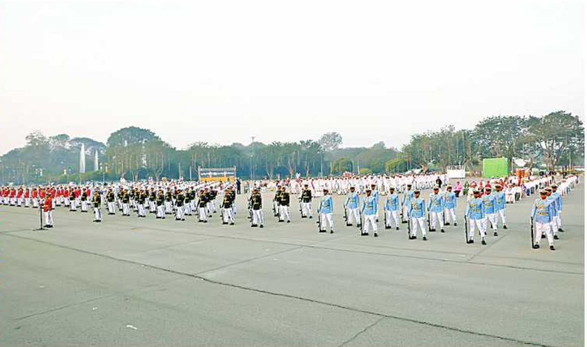
နိုင်ငံတော်စီမံအုပ်ချုပ်ရေးကောင်စီဥက္ကဋ္ဌ နိုင်ငံတော်ဝန်ကြီးချုပ် ဗိုလ်ချုပ်မှူးကြီး သတိုးမဟာသရေစည်သူ သတိုးသီရိပျံချီမင်းအောင်လှိုင်ထံမှ (၇၆)နှစ်မြောက် ပြည်ထောင်စုနေ့အခမ်းအနားသို့ ပေးပို့သည့်သဝဏ်လွှာကို နိုင်ငံတော်စီမံအုပ်ချုပ်ရေးကောင်စီဒုတိယဥက္ကဋ္ဌ ဒုတိယဝန်ကြီးချုပ် ဒုတိယဗိုလ်ချုပ်မှူးကြီး သီရိပျံချီ မဟာသရေစည်သူစိုးဝင်းက ဖတ်ကြားစဉ်။

နေပြည်တော် ပေဖော်ဝါရီ ၁၂ ပိုင်းတွင် နေပြည်တော်ရှိ မြို့တော်ခန်းမ ဥပစာ တက်ရောက်၍ နိုင်ငံတော်စီမံအုပ်ချုပ်ရေးကောင်စီ သဝဏ်လွှာကို ဖတ်ကြားသည်။ ၂၀၂၃ ခုနှစ် (၇၆)နှစ်မြောက် ပြည်ထောင်စုနေ့ ရင်ပြင်၌ ကျင်းပရာ နိုင်ငံတော်စီမံအုပ်ချုပ်ရေး ဥက္ကဋ္ဌ နိုင်ငံတော်ဝန်ကြီးချုပ် ဗိုလ်ချုပ်မှူးကြီး (၇၆)နှစ်မြောက် ပြည်ထောင်စုနေ့ကို တိုင်းရင်း နိုင်ငံတော်အလံတင်အခမ်းအနားနှင့် နိုင်ငံတော် ကောင်စီဒုတိယဥက္ကဋ္ဌ ဒုတိယဝန်ကြီးချုပ် ဒုတိယ သတိုးမဟာသရေစည်သူ သတိုးသီရိပျံချီ မဟာသရေစည်သူ သတိုးသီရိပျံချီ မင်းအောင်လှိုင်ထံမှပေးပို့သော ပြည်ထောင်စုနေ့ သားစည်းလုံးညီညွတ်မှု ထာဝစဉ်တည်တံ့ရေးနှင့် အလံအလေးပြုပွဲအခမ်းအနားကို ယနေ့နံနက် ဗိုလ်ချုပ်မှူးကြီး သီရိပျံချီ မဟာသရေစည်သူစိုးဝင်း မင်းအောင်လှိုင်ထံမှပေးပို့သော ပြည်ထောင်စုနေ့