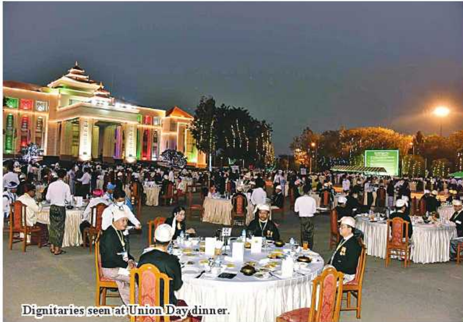
Dignitaries seen at Union Day dinner.

Dinner in honour of 76 th Anniversary Union Day of the year 2023 in progress.