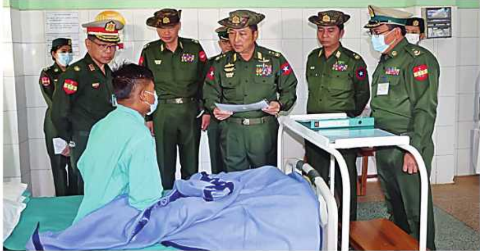
ကာကွယ်ရေး ဦးစီးချုပ်ရုံး(ကြည်း)မှ ဒုတိယဗိုလ်ချုပ်ကြီး တေဧကျော် တပ်မတော်ဆေးရုံ၌ တက်ရောက်ကုသမှု ခံယူနေသူတစ်ဦးကို ရင်းရင်းနှီးနှီး မေးမြန်းအားပေးစကား ပြောကြားစဉ်။

နေပြည်တော် ဖေဖော်ဝါရီ ၁၂ မန္တလေးတိုင်းဒေသကြီး ပြင်ဦးလွင်မြို့ ရှိ နယ်မြေခံ တပ်မတော်ဆေးရုံ၌ တက်ရောက် ဆေးကုသမှုခံယူလျက်ရှိသည့် အရာရှိ၊ စစ်သည်၊ မိသားစုဝင်များ၊ စစ်မှုထမ်းဟောင်းအဖွဲ့ဝင်များ၊ မြန်မာနိုင်ငံ ရဲတပ်ဖွဲ့ဝင်များနှင့် ဒေသခံပြည်သူများကို ယနေ့တွင် ကာကွယ်ရေးဦးစီးချုပ်ရုံး(ကြည်း)