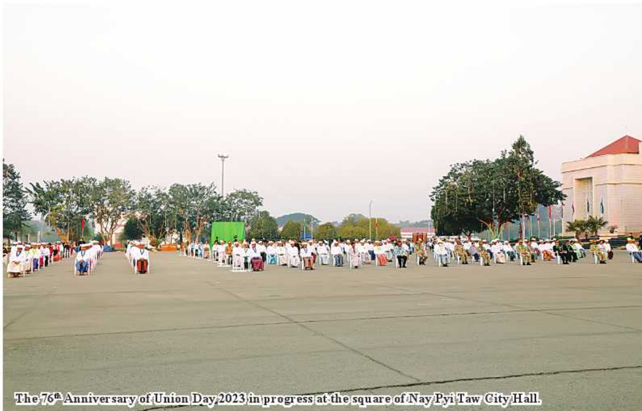
The 76 th Anniversary of Union Day 2023 in progress at the square of Nay Pyi Taw City Hall.

The State Flag-saluting ceremony was held at 7am and the military guard of honour (Army, Navy and Air) took its position at the square. See Page 15