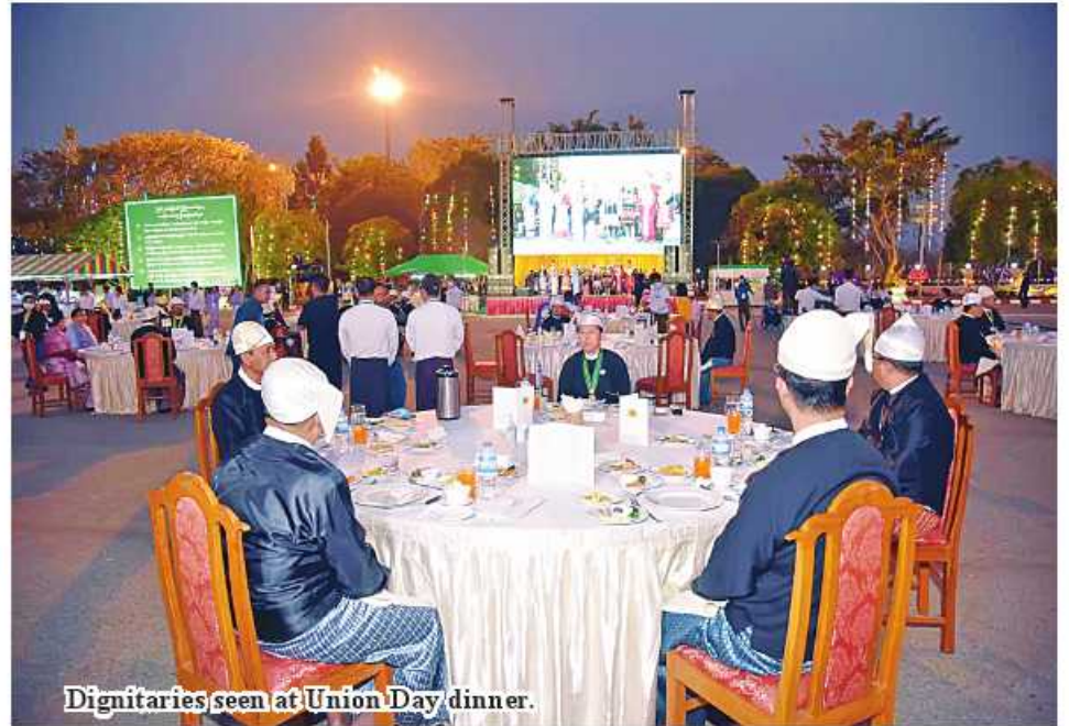
Dignitaries seen at Union Day dinner.