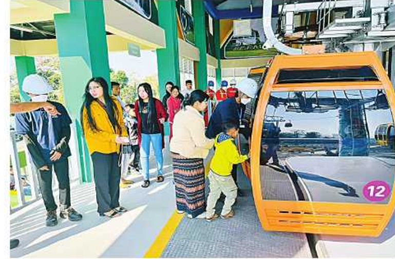
ပွဲကောက်ရေတံခွန်အပန်းဖြေစခန်း (BE.FALLS) တွင် Sky Cable Car စီးနင်းမည့် ပြည်သူများကိုတွေ့ရစဉ်။

နေပြည်တော် ဖေဖော်ဝါရီ ၁၂ (၇၆)နှစ်မြောက် ပြည်ထောင်စုနေ့ကို ဂုဏ်ပြုကြိုဆိုသောအားဖြင့် မန္တလေးတိုင်း ဒေသကြီး ပြင်ဦးလွင်မြို့ရှိ ပွဲကောက် ရေတံခွန်အပန်းဖြေစခန်း (BE.FALLS) တွင် Sky Cable Car စတင်ဖွင့်လှစ်ပြေးဆွဲ ခဲ့ကြောင်း သိရသည်။ ပြင်ဦးလွင်-လားရှိုး ကားလမ်းမကြီး အနီးရှိ ပွဲကောက်ရေတံခွန်အပန်းဖြေစခန်း (BE.FALLS)ကို နိုင်ငံတကာအဆင့်မီ အပန်းဖြေစခန်းတစ်ခုအဖြစ် အဆင့်မြှင့် တင်ခြင်းလုပ်ငန်းများကို ဆောင်ရွက်ခဲ့ကာ ၂၀၂၁ ခုနှစ် ဒီဇင်ဘာလက စတင်ဖွင့်လှစ် ခဲ့ပြီး အေးချမ်းပျော်ရွှင်စွာ လာရောက် လေ့လာ အပန်းဖြေအနားယူသူများဖြင့် နေ့စဉ် စည်ကားလျက်ရှိကြောင်း သိရသည်။