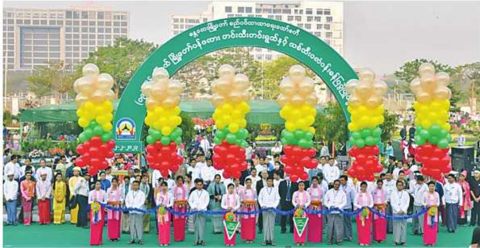
(၇၆)နှစ်မြောက် ပြည်ထောင်စုနေ့အထိမ်းအမှတ် ဟင်းသီးဟင်းရွက်နှင့် သစ်သီးဝလံပန်းမန်ပြပွဲကို တာဝန်ရှိသူများက ဖဲကြီးဖြတ်ဖွင့်လှစ်ပေးစဉ်။

ပေးအပ်ချီးမြှင့်ကြပြီး တက်ရောက်လာသူ များကို တိုင်းရင်းသားရိုးရာအစားအစာ စတုဒိသာများဖြင့် တည်ခင်းညော်ခွဲကြ ကြောင်း သိရသည်။ ညပိုင်းတွင် တိုင်းဒေသကြီးနှင့်ပြည်နယ် အသီးသီး၊ ကိုယ်ပိုင်အုပ်ချုပ်ခွင့်ရ တိုင်း၊ ဒေသတို့၌ ရောင်စုံမီးပန်းအလှများနှင့် ပျော်ပွဲရွှင်ပွဲများ အသီးသီးကျင်းပခဲ့ကြ ကြောင်း သတင်းရရှိသည်။