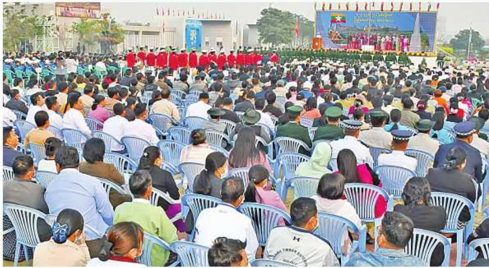
အလယ်ပိုင်းတိုင်းစစ်ဌာနချုပ်၌ (၇၆)နှစ်မြောက် ပြည်ထောင်စုနေ့အထိမ်းအမှတ်အခမ်းအနား ကျင်းပ နေမှုကို တွေ့ရစဉ်။