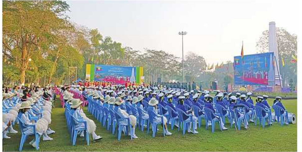
အရှေ့တောင်တိုင်းစစ်ဌာနချုပ်၌ (၇၆)နှစ်မြောက် ပြည်ထောင်စုနေ့အထိမ်းအမှတ်အခမ်းအနား ကျင်းပ နေမှုကို တွေ့ရစဉ်။

ဌာနချုပ်အသီးသီးမှ တိုင်းမှူးများနှင့် တာဝန်ရှိသူများ၊ ပြည်နယ်အဆင့် ဌာန ဆိုင်ရာတာဝန်ရှိသူများ၊ လူမှုရေးအသင်း အဖွဲ့များ၊ ကျောင်းသား၊ ကျောင်းသူများ နှင့် ဒေသခံပြည်သူများ တက်ရောက် ကြသည်။