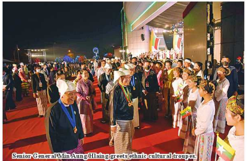
Senior General Min Aung Hlaing greets ethnic cultural troupes.