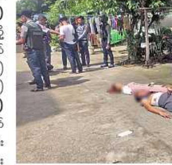
၂၀၂၂ ခုနှစ် ဇူလိုင် ၁၈ ရက်တွင် လှိုင်မြို့နယ် (၂) ရပ်ကွက် ဘုရင့်နောင်(၉)လမ်းပေါ်၌ တပ်မတော်အရာရှိတစ်ဦး နှင့် အပြစ်မဲ့ပြည်သူတစ်ဦးတို့ကို အကြမ်းဖက်သမားများက သေနတ်ဖြင့် ပစ်ခတ်လုပ်ကြံသတ်ဖြတ်ခဲ့သည့် မှတ်တမ်းဓာတ်ပုံ။