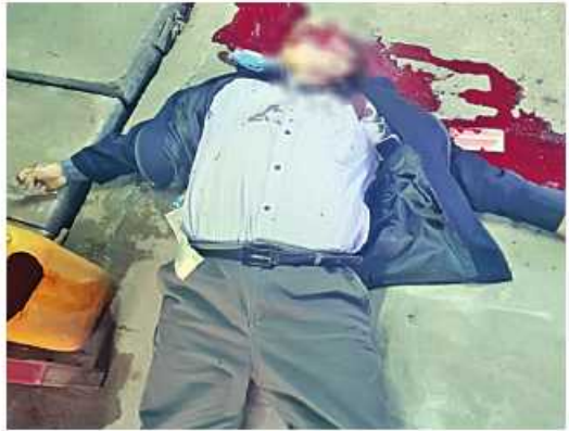
၂၀၂၃ ခုနှစ် ဇန်နဝါရီ ၃၀ ရက်တွင် လှိုင်မြို့နယ် အမှတ်(၂)ရပ်ကွက် ဘုရင့်နောင်လမ်း ရတနာမွန်အိမ်ရာ၌ စစ်မှုထမ်းဟောင်းတစ်ဦးကို အကြမ်းဖက်သမားများက သေနတ်ဖြင့် ပစ်ခတ်လုပ်ကြံသတ်ဖြတ်ခဲ့သည့် မှတ်တမ်းဓာတ်ပုံ။