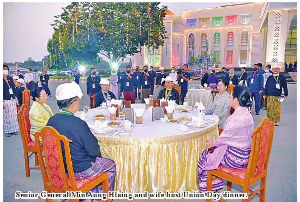
Senior General Min Aung Hlaing and wife host Union Day dinner.

The SAC Secretary and wife, SAC members and their wives, members of SAC Central Advisory Board, retired senior military officers, See Page 13