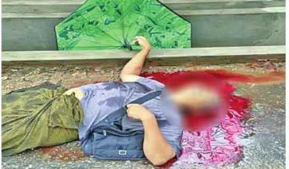
၂၀၂၂ ခုနှစ် ဇူလိုင် ၁၅ ရက်တွင် မရမ်းကုန်းမြို့နယ် ဦးအောင်ပွင့်လမ်းပေါ်၌ ရာအိမ်မှူးတစ်ဦးကို အကြမ်းဖက် သမားများက သေနတ်ဖြင့် ပစ်ခတ်လုပ်ကြံသတ်ဖြတ်ခဲ့သည့် မှတ်တမ်းဓာတ်ပုံ။