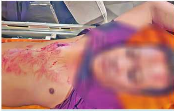
၂၀၂၂ ခုနှစ် အောက်တိုဘာ ၆ ရက်တွင် မရမ်းကုန်းမြို့နယ် ဘုရင့်နောင်(၁)ရပ်ကွက် တပင်ရွှေထီးလမ်း၌ စစ်မှုထမ်းဟောင်း တစ်ဦးကို အကြမ်းဖက်သမားများက သေနတ်ဖြင့် ပစ်ခတ်လုပ်ကြံသတ်ဖြတ်ခဲ့သည့် မှတ်တမ်းဓာတ်ပုံ။