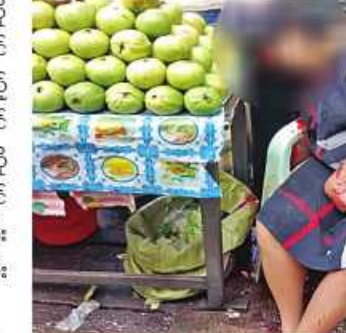
၂၀၂၂ ခုနှစ် ဇူလိုင် ၄ ရက်တွင် ကမာရွတ်မြို့နယ် (၃) ရပ်ကွက် လှည်းတန်း(၂)လမ်းထိပ်၌ အပြစ်မဲ့ပြည်သူတစ်ဦးကို အကြမ်းဖက်သမားများက သေနတ်ဖြင့် ပစ်ခတ်လုပ်ကြံ သတ်ဖြတ်ခဲ့သည့် မှတ်တမ်းဓာတ်ပုံ။