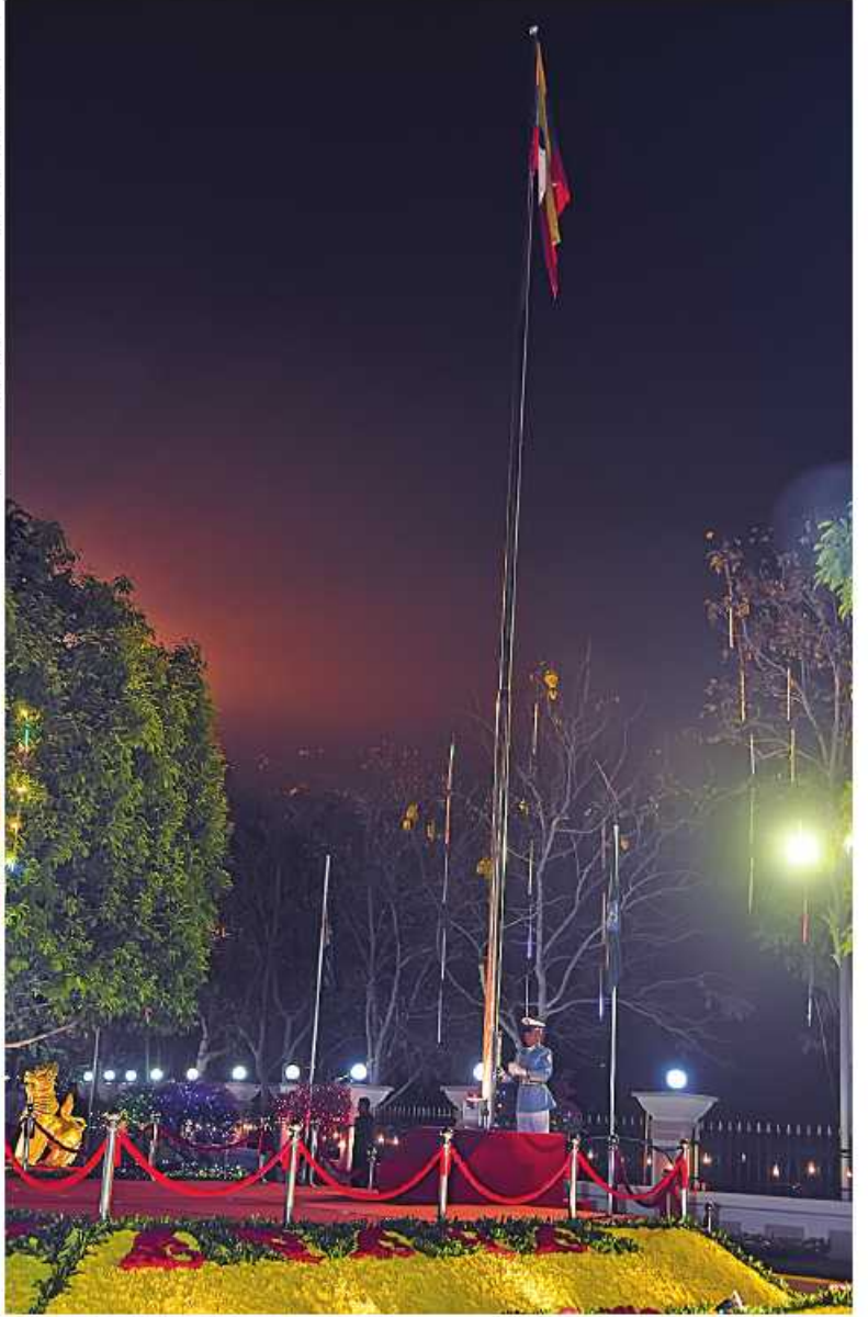
(၇၆)နှစ်မြောက် ပြည်ထောင်စုနေ့ နိုင်ငံတော်အလံတင်အခမ်းအနားတွင် တိုင်းရင်းသား၊ တိုင်းရင်းသူများနှင့်အတူ အလံတင်တပ်ဖွဲ့က ပြည်ထောင်စုသမ္မတမြန်မာနိုင်ငံတော်အလံကို လွှင့်တင်စဉ်။

တိုင်းဒေသကြီးအားလုံး တစ်ပြေးညီဖွံ့ဖြိုးတိုးတက်ရေးနှင့် တစ်မျိုးသားလုံးကျန်းမာကြံ့ခိုင်ပြီး အလုပ်အကိုင်အခွင့်အလမ်းများ တိုးတက်အောင် ဆောင်ရွက်ပေးရေး၊ တိုင်းရင်းသားညီအစ်ကို မောင်နှမများ၏ ရင်းနှီးချစ်ကြည်မှု၊ စည်းလုံးညီညွတ်မှု၊ စုစည်းလုပ်ဆောင်မှုတို့ဖြင့် စစ်မှန်၍ စည်းကမ်းပြည့်ဝသော ပါတီစုံဒီမိုကရေစီစနစ်ကိုကျင့်သုံးပြီး ဒီမိုကရေစီနှင့်ဖက်ဒရယ်စနစ်ကို အခြေခံသည့် ပြည်ထောင်စုကို တည်ဆောက်ရေးဟူသည့် အမျိုးသားရေးဦးတည်ချက် (၅)ရပ်ဖြင့် အနှစ်သာရပြည့်ဝစွာ ကျင်းပခြင်းဖြစ်သည်။ ဦးစွာ (၇၆)နှစ်မြောက် ပြည်ထောင်စုနေ့ နိုင်ငံတော်အလံတင်အခမ်းအနားကို နံနက် ၅ နာရီတွင် ကျင်းပရာ တိုင်းရင်းသား၊ တိုင်းရင်းသူများနှင့်အတူ အလံတင်တပ်ဖွဲ့က ပြည်ထောင်စုသမ္မတမြန်မာနိုင်ငံတော်အလံကို လွှင့်တင်သည်။ ယင်းနောက် နိုင်ငံတော်အလံအလေးပြုဖွဲ့အခမ်းအနားသို့ တက်ရောက်အလေးပြုကြမည့် ဌာနဆိုင်ရာဝန်ထမ်းများ၊ လူမှုရေးအသင်းအဖွဲ့များ၊ တိုင်းရင်းသား၊ တိုင်းရင်းသူများနှင့် ဖိတ်ကြားထားသူများသည် နံနက် ၅ နာရီမှစတင်၍ အခမ်းအနား