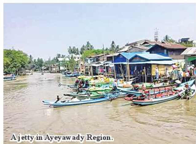
A jetty in Ayeyawady Region.