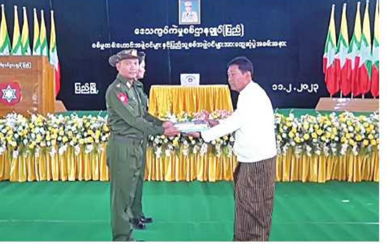
တောင်ပိုင်းတိုင်းစစ်ဌာနချုပ် တိုင်းမှူး ဗိုလ်ချုပ်ထိန်ဝင်း ဓစ်မှုထမ်းဟောင်းအဖွဲ့ ဝင်များအတွက် စားသောက်ဖွယ်ရာများပေးအပ်စဉ်။

ဦးစွာ တိုင်းမှူးက အဖွင့်အမှာစကားပြော ကြားသည်။ ထို့နောက် စစ်မှုထမ်းဟောင်း ညှိနှိုင်းဆောင်ရွက်ပေးခဲ့ကြောင်း သတင်း အဖွဲ့ဝင်များနှင့် ပြည်သူ့စစ်(ဌာနေ)အဖွဲ့ဝင်