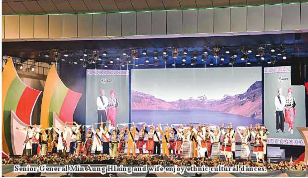
Senior General Min Aung Hlaing and wife enjoy ethnic cultural dances.