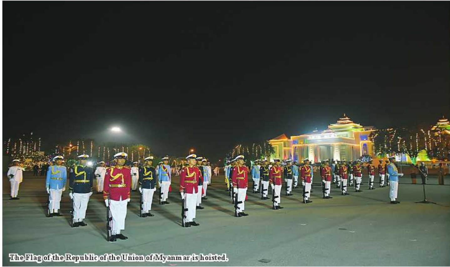
The Flag of the Republic of the Union of Myanmar is hoisted.

deputy ministers, members of the Union Civil Service Board, Myanmar National Human Rights Commission, Anti-Corruption Commission and Nay Pyi Taw Council, staff members of various ministries, members of ethnic cultural troupes, ethnic representatives and guests.