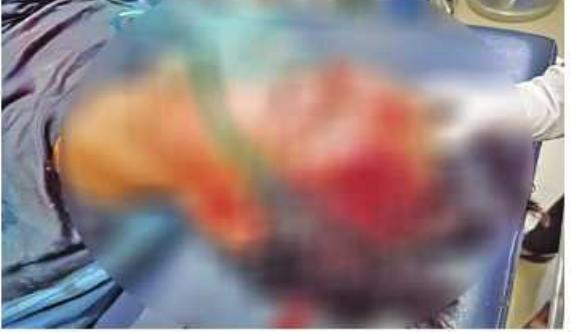
၂၀၂၂ ခုနှစ် ဩဂုတ် ၃၀ ရက်တွင် အင်းစိန်မြို့နယ် ဈေးကုန်းအရှေ့ရပ်ကွက် အင်းစိန်ဈေးအနီး၌ အပြစ်မဲ့ပြည်သူ တစ်ဦးကို အကြမ်းဖက်သမားများက သေနတ်ဖြင့် ပစ်ခတ် လုပ်ကြံသတ်ဖြတ်ခဲ့သည့် မှတ်တမ်းဓာတ်ပုံ။