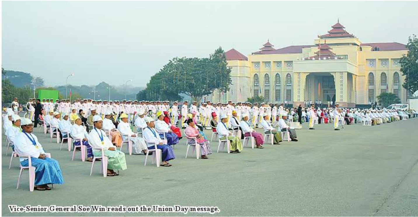
Vice-Senior General Soe Win reads out the Union Day message.