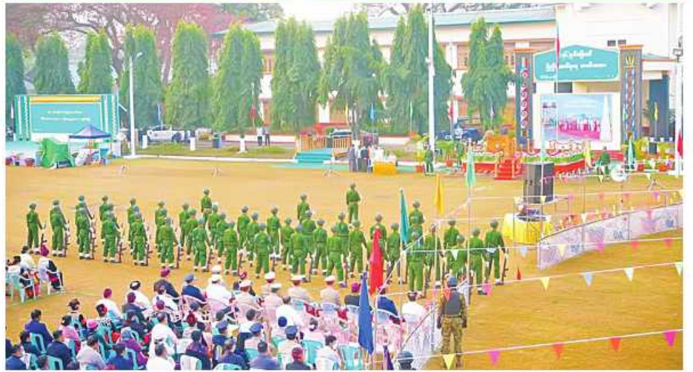
မြောက်ပိုင်းတိုင်းစစ်ဌာနချုပ်၌ (၇၆)နှစ်မြောက် ပြည်ထောင်စုနေ့အထိမ်းအမှတ်အခမ်းအနား ကျင်းပ နေမှုကို တွေ့ရစဉ်။

နေပြည်တော် ဖေဖော်ဝါရီ ၁၂ ပြည်ထောင်စုသမ္မတမြန်မာနိုင်ငံတော်၏ ယနေ့တွင်ကျရောက်သည့် (၇၆)နှစ်မြောက် ပြည်ထောင်စုနေ့အထိမ်းအမှတ်အခမ်းအနား များကို တိုင်းဒေသကြီးနှင့် ပြည်နယ်များ၊ ကိုယ်ပိုင်အုပ်ချုပ်ခွင့်ရ တိုင်း၊ ဒေသ အသီးသီးတို့၌ စည်ကားသိုက်မြိုက်စွာ ကျင်းပပြုလုပ်ကြရာ တိုင်းဒေသကြီးနှင့် ပြည်နယ်အလိုက် ဝန်ကြီးချုပ်များ၊ တိုင်းစစ်