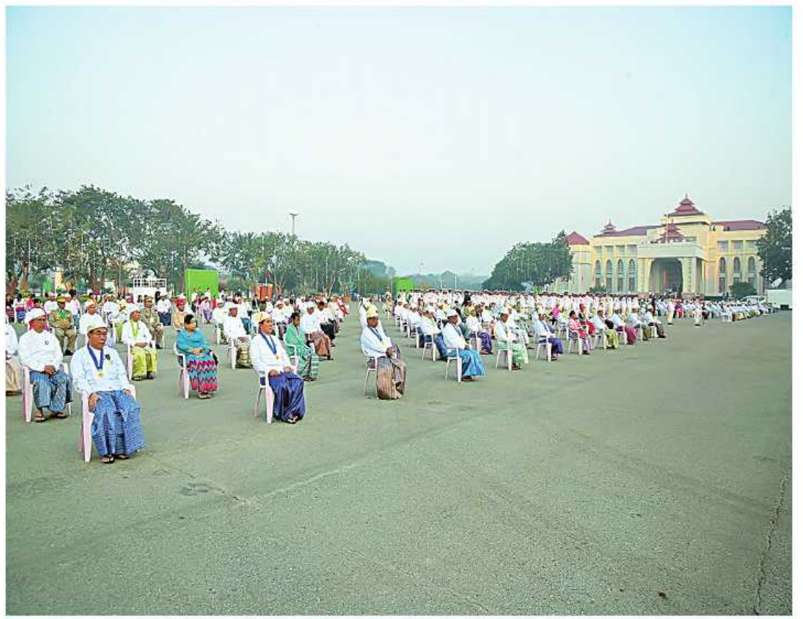
(၇၆)နှစ်မြောက် ပြည်ထောင်စုနေ့ နိုင်ငံတော်အလံအလေးပြုဖွဲ့အခမ်းအနား တက်ရောက်လာကြသူများကို တွေ့ရစဉ်။

အနားကျင်းပမည့် မြို့တော်ခန်းမဥပစာရင်ပြင်ရှိ စင်မြင့်ပေါ်၌နေရာယူပြီး ဂုဏ်ပြုတပ်ဖွဲ့၏ အလေးပြုခြင်းကို ခံယူသည်။ ထို့နောက် နိုင်ငံတော်စီမံအုပ်ချုပ်ရေးကောင်စီ ဒုတိယဥက္ကဋ္ဌသည် တက်ရောက်လာကြသူများနှင့်အတူ ပြည်ထောင်စုသမ္မတမြန်မာနိုင်ငံတော်အလံကို အလေးပြုရာ ဂုဏ်ပြုတပ်ဖွဲ့က နိုင်ငံတော်သီချင်းကို တီးမှုတ်သည်။ ယင်းနောက် နိုင်ငံတော်စီမံအုပ်ချုပ်ရေးကောင်စီဥက္ကဋ္ဌ နိုင်ငံတော်ဝန်ကြီးချုပ် ဗိုလ်ချုပ်မှူးကြီး သတိုးမဟာသရေစည်သူ သတိုးသီရိသုဓမ္မ မင်းအောင်လှိုင်ထံမှ (၇၆)နှစ်မြောက် ပြည်ထောင်စုနေ့အခမ်းအနားသို့ ပေးပို့သည့် သဝဏ်လွှာကို နိုင်ငံတော်စီမံအုပ်ချုပ်ရေးကောင်စီ ဒုတိယဥက္ကဋ္ဌ ဒုတိယဝန်ကြီးချုပ် ဒုတိယဗိုလ်ချုပ်မှူးကြီး သီရိပျံချီ မဟာသရေစည်သူစိုးဝင်းက ဖတ်ကြားပြီး အခမ်းအနားကို ရှုပ်သိမ်းလိုက်သည်။ အခမ်းအနားသို့ ပြည်ထောင်စုဝန်ကြီးများ၊ ပြည်ထောင်စုစာရင်းစစ်ချုပ်၊ ပြည်ထောင်စုရာထူးဝန်အဖွဲ့ဥက္ကဋ္ဌနေပြည်တော်ကောင်စီဥက္ကဋ္ဌတပ်မတော်အရာရှိကြီးများ၊ ပြည်ထောင်စုတရားလွှတ်တော်ချုပ်