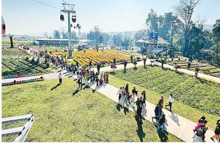
ပွဲကောက်ရေတံခွန်အပန်းဖြေစခန်း (BE.FALLS) တွင် အေးချမ်းပျော်ရွှင်စွာ လာရောက်လေ့လာ အပန်းဖြေအနားယူသူများဖြင့် စည်ကားလျက်ရှိစဉ်။

ယခုအခါ ပွဲကောက်ရေတံခွန် အပန်း ဖြေစခန်း (BE.FALLS)အနေဖြင့် (၇၆) နှစ်မြောက် ပြည်ထောင်စုနေ့ကို ဂုဏ်ပြု ကြိုဆိုသောအားဖြင့် ပတ်ဝန်းကျင်ရှင်း သားများကို အမြင့်မှ ကြည့်ရှုနိုင်ပြီး ရင်ခုန်