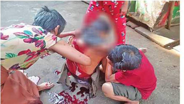
၂၀၂၃ ခုနှစ် ဖေဖော်ဝါရီ ၃ ရက်တွင် လှိုင်မြို့နယ် အမှတ်(၁)ရပ်ကွက် ဝေယျမာလာ(၂)လမ်း၌ မီးသတ်တပ်ဖွဲ့ဝင်တစ်ဦးကို အကြမ်းဖက်သမားများက သေနတ်ဖြင့် ပစ်ခတ်လုပ်ကြံသတ်ဖြတ်ခဲ့သည့် မှတ်တမ်းဓာတ်ပုံ။