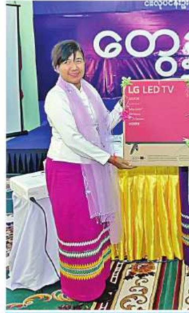
နိုင်ငံတော်စီမံအုပ်ချုပ်ရေးကောင်စီဥက္ကဋ္ဌ နိုင်ငံတော်ဝန်ကြီးချုပ် ဗိုလ်ချုပ်မှူးကြီး မင်းအောင်လှိုင်က ကျောင်းအုပ်ဆရာမကြီး ဒေါ်စိုးသူစာမောင်အား ကျောင်းသား၊ ကျောင်းသူများအသုံးပြုရန် သင်ကြားမှု၊ သင်ယူမှုအထောက်အကူပြုပစ္စည်းများ ပေးအပ်စဉ်။

ရွက်ရာတွင် စနစ်တကျကွင်းဆင်းစစ်ဆေး ပြီး ထွက်ချက်ဆောင်ရွက်ရန်လိုကြောင်း၊ အမှန်တကယ်အသုံးဝင်ပြီး ဒေသနှင့် ကုန်ထုတ်လုပ်မှုကို အကျိုးပြုသည့် လမ်းကြောင်းဖြစ်ရန်လိုကြောင်း၊ ထို့ပြင် ရွှေမုယင်းဒေသမှထွက်ရှိသည့် ငါးများကို ကနဦး ပထမအဆင့်သန့်စင်ပြီး အအေး ခန်းပို့ဆောင်ရေးယာဉ်များ အသုံးပြု၍ ဈေးကွက်သို့ပြန့်ချိနိုင်ရေး ဆောင်ရွက်နိုင် စစ်ဆေးပြီး လိုအပ်သည်များမှာကြားသည်။