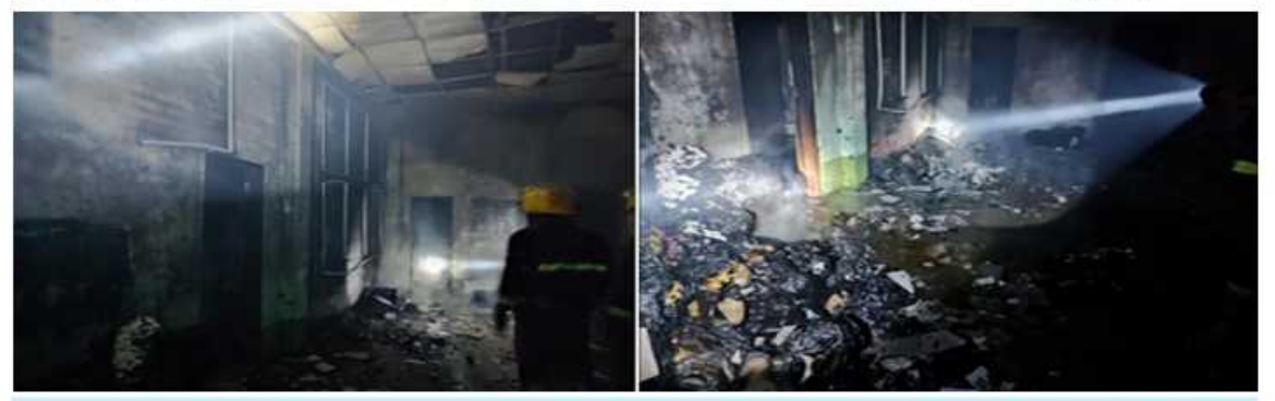
PDF အမည်ခံအကြမ်းဖက်သမားများက တနင်္သာရီတိုင်းဒေသကြီး လောင်းလုံမြို့ရှိ မြို့နယ်သစ်တောဦးစီးဌာနရုံးကို မီးရှို့ပျက်ဆီးထားမှုကို တွေ့ရစဉ်။

ခဲ့ရာ လုံခြုံရေးတပ်ဖွဲ့ဝင်များနှင့် မီးသတ်တပ်ဖွဲ့ဝင်များ ပူးပေါင်း၍ မီးသတ်ယာဉ် နှစ်စီးဖြင့် သွားရောက်မီးငြိမ်းသတ်ခဲ့ရာ နံနက် ၃ နာရီ ၅၅ မိနစ်ခန့်တွင် မီးငြိမ်းသွားခဲ့ကြောင်း၊ ထိုသို့ အကြမ်းဖက်သမားများ၏ မီးရှို့ပျက်ဆီးမှုကြောင့် သွပ်မိုး၊ အုတ်ကာဆောက်လုပ်ထားသည့် ရုံးတစ်ထပ် အဆောက်အအုံ တစ်လုံး၊ ရုံးအတွင်း ထားရှိသည့် ကွန်ပျူတာ နှစ်လုံး၊ ပရင်တာ သုံးလုံး၊ သစ်ဖြတ်စက်(Chain Saw) တစ်လုံးနှင့် ရုံးသုံးစာရွက်စာတမ်းများမီးလောင်ပျက်စီးဆုံးရှုံးခဲ့ကြောင်း သိရသည်။ ထိုသို့ မြို့နယ်သစ်တောဦးစီးဌာနရုံး