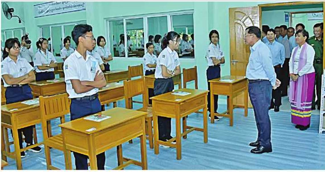
နိုင်ငံတော်စီမံအုပ်ချုပ်ရေးကောင်စီဥက္ကဋ္ဌ နိုင်ငံတော်ဝန်ကြီးချုပ် ဗိုလ်ချုပ်မှူးကြီးမင်းအောင်လှိုင် စိုက်ပျိုးရေး၊ မွေးမြူရေးနှင့် ဆည်မြောင်းဝန်ကြီးဌာန၊ ငါးလုပ်ငန်းဦးစီးဌာနလက်အောက်ရှိ ငါးလုပ်ငန်းသိပ္ပံ(တွဲတေး)အတွင်း လှည့်လည်ကြည့်ရှုစဉ်။

စာမျက်နှာ ၁၈ မှအဆက် ယင်းနောက် နိုင်ငံတော်စီမံအုပ်ချုပ်ရေးကောင်စီဥက္ကဋ္ဌ နိုင်ငံတော်ဝန်ကြီးချုပ်က အမှာစကားပြောကြားရာတွင် မိမိတို့နိုင်ငံသည် မြစ်ချောင်းအင်းအိုင်များပေါများပြီး ပင်လယ်ကမ်းရိုးတန်း ရှည်လျားစွာ ပိုင်ဆိုင်ထားကြောင်း၊ ငါးမွေးမြူရေးလုပ်ငန်းများဆောင်ရွက်နိုင်သည့် နေရာများစွာရှိခြင်းကြောင့် ငါးမွေးမြူရေးနှင့် ပတ်သက်၍ သိပ္ပံကျောင်းဖွင့်နိုင်ရန် စီမံဆောင်ရွက်ခဲ့ကြောင်း၊ ငါးသည် စားရေးအတွက် များစွာအထောက်အကူပြုစေနိုင်သည့်အတွက် ငါးလုံလောက်စွာရရှိရေး စနစ်တကျဖြင့် မွေးမြူနိုင်ရန်အတွက် သုတေသနပြု ဆောင်ရွက်ရန်လိုကြောင်း၊ ရေချိုပစ္စုန်နှင့်ရေငန်ပစ္စုန်မွေးမြူရေးလုပ်ငန်းများ တိုးတက်ရေးအတွက်လည်း သုတေသနပြုလုပ်ရန်လိုကြောင်း၊ ငါးနှင့် ပုစွန်မွေးမြူရေးအောင်မြင်ရန်အတွက် လူသားအရင်းအမြစ်ကောင်းများ များစွာလိုအပ်ပြီး ယခုကျောင်းမှတစ်ဆင့် ပညာရှင်များပေါ်ထွန်းလာမည်ဖြစ်သဖြင့် ဂုဏ်ယူပါကြောင်း၊ အဆင့်မြင့်ပညာရပ်များကို ဆက်လက်သင်ကြားနိုင်ရန်အတွက် သိပ္ပံကျောင်းမှတစ်ဆင့် တက္ကသိုလ်နှင့် ကောလိပ်များကို ဖွင့်လှစ်ပေးသွားမည်ဖြစ်ကြောင်း၊ နိုင်ငံတစ်ဝန်း ခရိုင် ၅၀ ရှိ အထက်တန်းကျောင်းများတွင် စိုက်ပျိုးရေး၊ မွေးမြူရေး၊ နည်းပညာနှင့် စက်မှုသင်တန်းများကို လာမည့်ပညာသင်နှစ်မှစတင်၍ ဖွင့်လှစ်သင်ကြားပေးသွားမည်ဖြစ်ကြောင်း၊ စိုက်ပျိုးရေး၊ မွေးမြူရေး၊ စက်မှုနှင့် နည်းပညာဘာသာရပ်များကို သင်ကြားပေးသွားမည်ဖြစ်ကြောင်း၊ အဆိုပါသင်တန်းကျောင်းများမှ ထူးချွန်သည့် ကျောင်းသား၊ ကျောင်းသူများအနေဖြင့် အဆင့်မြင့်ပညာရပ်များ ဆက်လက်သင်ကြားနိုင်မည်ဖြစ်ကြောင်း၊