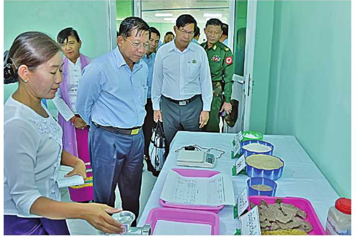
နိုင်ငံတော်စီမံအုပ်ချုပ်ရေးကောင်စီဥက္ကဋ္ဌ နိုင်ငံတော်ဝန်ကြီးချုပ် ဗိုလ်ချုပ်မှူးကြီးမင်းအောင်လှိုင် စိုက်ပျိုးရေး၊ မွေးမြူရေးနှင့် ဆည်မြောင်းဝန်ကြီးဌာန၊ ငါးလုပ်ငန်းဦးစီးဌာနလက်အောက်ရှိ ငါးလုပ်ငန်းသိပ္ပံ(တွဲတေး)အတွင်း လှည့်လည်ကြည့်ရှုစဉ်။

ပညာသင်ကြားမှုများအပေါ် မူတည်၍ ယခုမွေးမြူရေးသိပ္ပံကျောင်းကို ကောလိပ်အဆင့်သို့ မြှင့်တင်ပေးသွားမည်ဖြစ်ကြောင်း၊ နိုင်ငံအတွက်လိုအပ်သည့် လူသားအရင်းအမြစ်များကို မွေးထုတ်ပေးနိုင်မည်ဖြစ်ကြောင်း၊ ဆရာ၊ ဆရာမများအနေဖြင့် ကျောင်းသား၊ ကျောင်းသူများအမှန်တကယ်တတ်မြောက်စေရေးအတွက် စနစ်တကျဖြင့် သင်ကြားလေ့ကျင့်မည်ဆိုပါက များစွာအကျိုးရှိမည်ဖြစ်ကြောင်း၊ သင်တန်းပြီးဆုံးသည့် အချိန်တွင်လည်း သင်ကြားခဲ့သည့် ဘာသာရပ်များနှင့် လျော်ညီသည့် လုပ်ငန်းများကို ဆောင်ရွက်စေလိုကြောင်း၊ လူမှန်၊ နေရာမှန်ရှိမှသာ နိုင်ငံဖွံ့ဖြိုးတိုးတက်မှုကို များစွာအထောက်အကူပြုမည်ဖြစ်ကြောင်း၊ လုပ်ငန်းခွင်သို့ ရောက်ရှိချိန်တွင်လည်း သင်ကြားပေးလိုက်သည့် ပညာရပ်များကို စနစ်တကျအသုံးပြုပြီး မိမိတို့၏ လုပ်ငန်းရပ်ဆိုင်းရာပညာများ ပိုမိုတိုးတက်အောင် လေ့လာဆောင်ရွက်