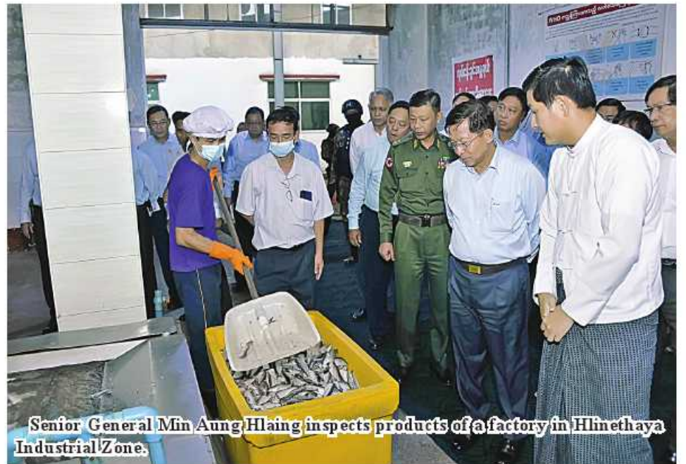
Senior General Min Aung Hlaing inspects products of a factory in Hlinethaya Industrial Zone.