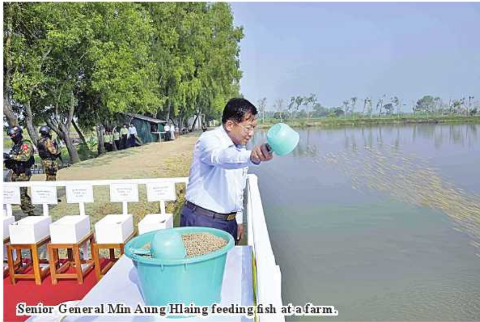
Senior General Min Aung Hlaing feeding fish at a farm.