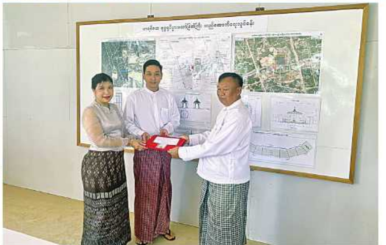
မာရဝိဇယဗုဒ္ဓရုပ်ပွားတော်မြတ်ကြီး ရတနာပလ္လင်တော်ထက် အလယ်ဗဟိုဌာနများတွင် ဌာပနာတော် ထပ်မံထည့်သွင်း သွင်းလှူပူဇော်နိုင်ရေး စေတနာရှင်၊ အလှူရှင်များက လာရောက်လှူဒါန်းလျက်ရှိစဉ်

ရတနာများ၊ ဌာပနာကုသိုလ်ပြုနိုင်ရန်အတွက် နိဗ္ဗာန်အကျိုးမျှော်၍ အသိပေးနှိုးဆော်ထားလျက်ရှိရာ ခုနစ်ရက် သားသမီး၊ ဘုရားဒါယကာ၊ ဒါယိကာမများ၊ စေတနာရှင်၊ အလှူရှင်များက ဝမ်းပန်းတသာဆက်သွယ်၍ ဌာပနာကုသိုလ်များကို ထည့်ဝင်လှူဒါန်းလျက်ရှိကြပြီး ယနေ့တွင် နေပြည်တော်ကောင်စီ ပြည်ထောင်စုနယ်မြေ၌ ရွှေထည် ၅၃ ကျပ်သား ၁၃ ပဲ တစ်ရွေး၊ ကျောက်မျက်ရတနာပါရွှေထည်ပစ္စည်း ၉၈ ကျပ်သား ကိုးပဲ လေးရွေး၊ ဓာတ်တော်မွေတော်၊ ပုလဲနှင့် ကျောက်မျက်ရတနာ