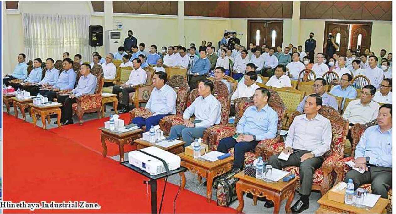
Senior General Min Aung Hlaing meets entrepreneurs at Hlinethaya Industrial Zone.

Nay Pyi Taw February 5 Chairman of the State Administration Council Prime Minister Senior General Min Aung Hlaing met with industrial zone committee chairmen and members of various industrial zones in Yangon Region and MSME entrepreneurs at Kanaung Hall of Hlinethaya Industrial Zone and discussed industrial development this afternoon.