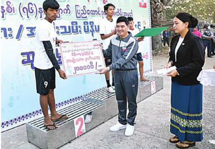
ရန်ိုင်ပြည်နယ်ဝန်ကြီးချုပ် ဦးထိန်လင်းက ဆုရရှိသည့် အားကစားသမားတစ်ဦးကို ဂုဏ်ပြုဆုပေးအပ်ချီးမြှင့်စဉ်။

နေပြည်တော် ဖေဖော်ဝါရီ ၅ ၂၀၂၃ ခုနှစ် ဖေဖော်ဝါရီ ၁၂ ရက်တွင် ကျရောက်မည့်(၇၆)နှစ်မြောက် ပြည်ထောင်စုနေ့ကို ဂုဏ်ပြုကြိုဆိုသော အားဖြင့် အမျိုးသား၊ အမျိုးသမီး မိနီမာရသွန်အပြေးပြိုင်ပွဲကို ယနေ့နံနက်ပိုင်းတွင် ရခိုင်ပြည်နယ် စစ်တွေမြို့ ကမ်းနားလမ်းနှင့် ရွှာခင်းသာလမ်းဆုံရှိ စစ်တွေမြို့စာတိုက်ကြီးရှေ့၌ ပြုလုပ်ရာ ပြည်နယ်ဝန်ကြီးချုပ် ဦးထိန်လင်း၊ အနောက်ပိုင်းတိုင်းစစ်ဌာနချုပ် တိုင်းမှူး ဗိုလ်ချုပ်ထင်လတ်ဦးနှင့် ပြည်နယ်ဝန်ကြီးများ၊ ဌာနဆိုင်ရာများ၊ ကျောင်းသား၊ ကျောင်းသူများ၊ အားကစားဝါသနာရှင် လူငယ်များနှင့် ဒေသခံပြည်သူများ