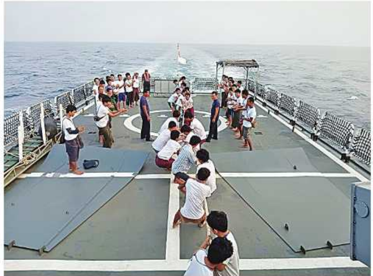
နေရပ်ပြန်မြန်မာနိုင်ငံသားများ စိတ်ရွှင်လန်းအပန်းဖြေစေရန် စစ်ရေယာဉ်(အနော်ရထာ)ပေါ်တွင် ဖျော်ဖြေရေးအစီအစဉ်များအားကစားပြိုင်ပွဲများ ကျင်းပပေးစဉ်။

ရန်ကုန်မြို့သို့ ပြန်လည်ရောက်ရှိလာကြသော နေရပ်ပြန်တို့ကို နယ်မြေခံရတပ်ကွပ်ကဲမှုဌာနချုပ်မှူး ဗိုလ်ချုပ်ထိန်ဝင်း၊ ရန်ကုန်တိုင်းဒေသကြီး လုံခြုံရေးနှင့်နယ်စပ်ရေးရာဝန်ကြီးဌာန ဝန်ကြီး ဗိုလ်မှူးကြီးဝင်းတင့်၊ တပ်မတော်(ရေ)မှ အရာရှိ၊ စစ်သည်မိသားစုဝင်များ၊ တိုင်းဒေသကြီးနှင့် မြို့နယ်အဆင့် ဌာနဆိုင်ရာတာဝန်ရှိသူများနှင့် နေရပ်ပြန် မြန်မာနိုင်ငံသားများ၏ မိသားစုဝင်များက နွေးထွေးလှိုက်လှစွာ လာရောက်ကြိုဆိုကြသည်။