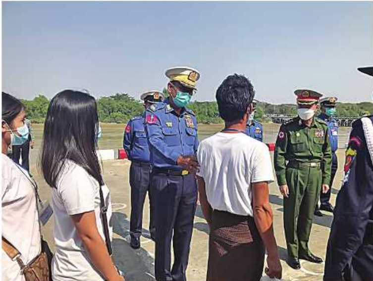
နယ်မြေခံရတပ်ကွပ်ကဲမှုဌာနချုပ်မှူး ဗိုလ်ချုပ်ထိန်ဝင်းက ရန်ကုန်မြို့သို့ ပြန်လည်ရောက်ရှိလာသည့် နေရပ်ပြန်မြန်မာနိုင်ငံသားများကို နွေးထွေးစွာကြိုဆိုခွတ်ဆက်စဉ်။

နိုင်ငံတော်စီမံအုပ်ချုပ်ရေး ကောင်စီ ဥက္ကဋ္ဌ တပ်မတော်ကာကွယ်ရေးဦးစီးချုပ် ဗိုလ်ချုပ်မှူးကြီးမင်းအောင်လှိုင်၏ လမ်းညွှန် မှာကြားချက်အရ ထိုင်းနိုင်ငံတွင် ရောက်ရှိနေပြီး အကြောင်းအမျိုးမျိုးကြောင့် မြန်မာနိုင်ငံသို့ပြန်လာရန် အခက်အခဲကြုံတွေ့ခဲ့ရသော နေရပ်ပြန်မြန်မာနိုင်ငံသား ၆၇၉ ဦး တို့အနက် ကော့သောင်းမြို့မှ မိုင်ပေါင်း ၄၅၅ မိုင်ခန့်ကွာဝေးသည့် ရန်ကုန်တိုင်းဒေသကြီးမှ နေရပ်ပြန်မြန်မာနိုင်ငံသား ၁၁၈ ဦးကို မြန်မာ့တပ်မတော်(ရေ)မှ စစ်ရေယာဉ်(ကျန်စစ်သား)ဖြင့် ခေါ်ဆောင်လာခဲ့ရာ ယနေ့မွန်းလွဲ ၂ နာရီတွင် ရန်ကုန်မြို့ အမှတ်(၃) ရေတပ်ဆိပ်ခံတံတား (သီလဝါ)သို့ ရောက်ရှိခဲ့သည်။