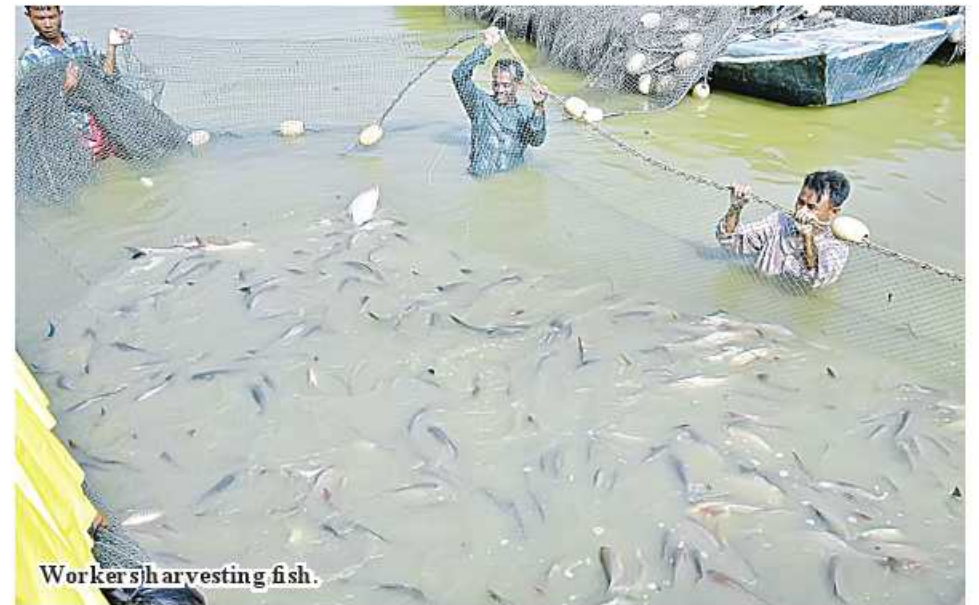
Workers harvesting fish.

The Fisheries Institute (Twantay) was launched on December 12, 2022 as the first and ever institute on fisheries with the guidance by the Chairman of State Administration Council and Prime Minister to ensure development of fishery technology and have job opportunities. The institute now has 18 male students and 23 female students for the first year course. Depending on the result of academic years, there is a plan to upgrade it to a college.