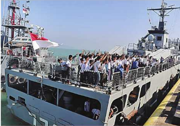
ထိုင်းနိုင်ငံတွင်ပြန်လာရန်အခက်အခဲများကြုံတွေ့ခဲ့သော မြန်မာနိုင်ငံသားများအနက် ရန်ကုန်တိုင်းဒေသကြီးနှင့် ရခိုင်ပြည်နယ် ကျောက်ဖြူမြို့တို့မှ နေရပ်ပြန်သူများကို တပ်မတော်(ရေ)မှ စစ်ရေယာဉ်ကြီးများဖြင့် စီစဉ်ပို့ဆောင်ပေးစဉ်။

ရန်ကုန်မြို့သို့ ပြန်လည်ရောက်ရှိလာကြသော နေရပ်ပြန်တို့ကို နယ်မြေခံရတပ်ကွပ်ကဲမှုဌာနချုပ်မှူး ဗိုလ်ချုပ်ထိန်ဝင်း၊ ရန်ကုန်တိုင်းဒေသကြီး လုံခြုံရေးနှင့်နယ်စပ်ရေးရာဝန်ကြီးဌာန ဝန်ကြီး ဗိုလ်မှူးကြီးဝင်းတင့်၊ တပ်မတော်(ရေ)မှ အရာရှိ၊ စစ်သည်မိသားစုဝင်များ၊ တိုင်းဒေသကြီးနှင့် မြို့နယ်အဆင့် ဌာနဆိုင်ရာတာဝန်ရှိသူများနှင့် နေရပ်ပြန် မြန်မာနိုင်ငံသားများ၏ မိသားစုဝင်များက နွေးထွေးလှိုက်လှစွာ လာရောက်ကြိုဆိုကြသည်။