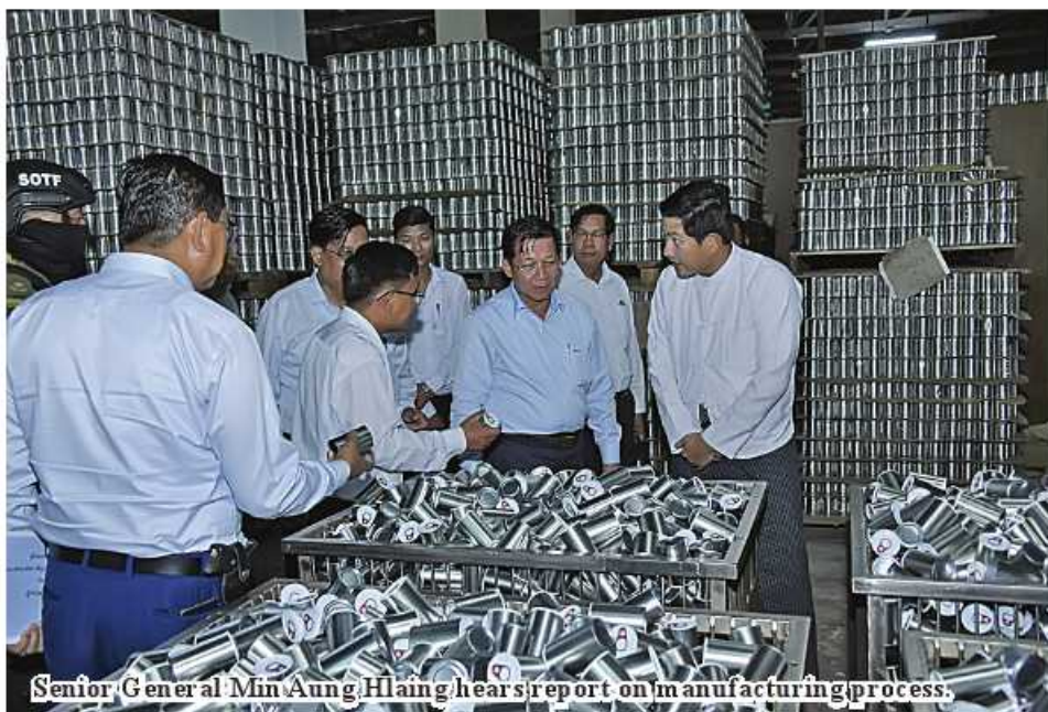
Senior General Min Aung Hlaing hears report on manufacturing process.