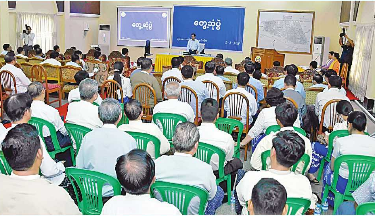
နိုင်ငံတော်စီမံအုပ်ချုပ်ရေးကောင်စီဥက္ကဋ္ဌ နိုင်ငံတော်ဝန်ကြီးချုပ် ဗိုလ်ချုပ်မှူးကြီးမင်းအောင်လှိုင် ရန်ကုန်တိုင်းဒေသကြီးအတွင်းရှိ စက်မှုဇုန်အသီးသီးမှ စက်မှုဇုန်ကော်မတီဥက္ကဋ္ဌများ၊ ကော်မတီဝင်များ၊ အသေးစား၊ အငယ်စားနှင့် အလတ်စားစီးပွားရေး(MSME)လုပ်ငန်းရှင်များနှင့် တွေ့ဆုံဆွေးနွေးစဉ်။

ရန်ကုန်တိုင်းဒေသကြီးအတွင်းရှိ စက်မှုဇုန်အသီးသီးမှ စက်မှုဇုန်ကော်မတီဥက္ကဋ္ဌများ၊ ကော်မတီဝင်များ၊ အသေးစား၊ အငယ်စားနှင့် အလတ်စားစီးပွားရေး(MSME)လုပ်ငန်းရှင်များနှင့် တွေ့ဆုံဆွေးနွေး