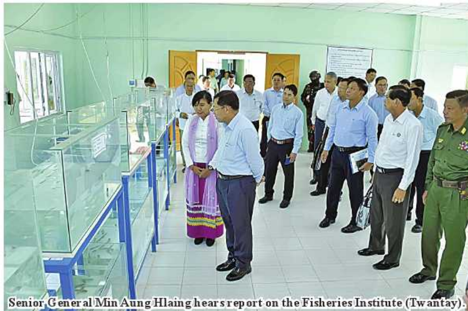
Senior General Min Aung Hlaing hears report on the Fisheries Institute (Twantay).

distribute enough fish to local residents at reasonable prices. Therefore, it is necessary to produce more fish at lower costs. If production costs are low, it is beneficial for the public, who will be able to consume fish nutrients, as well as for the region where fish breeding tasks are carried out.