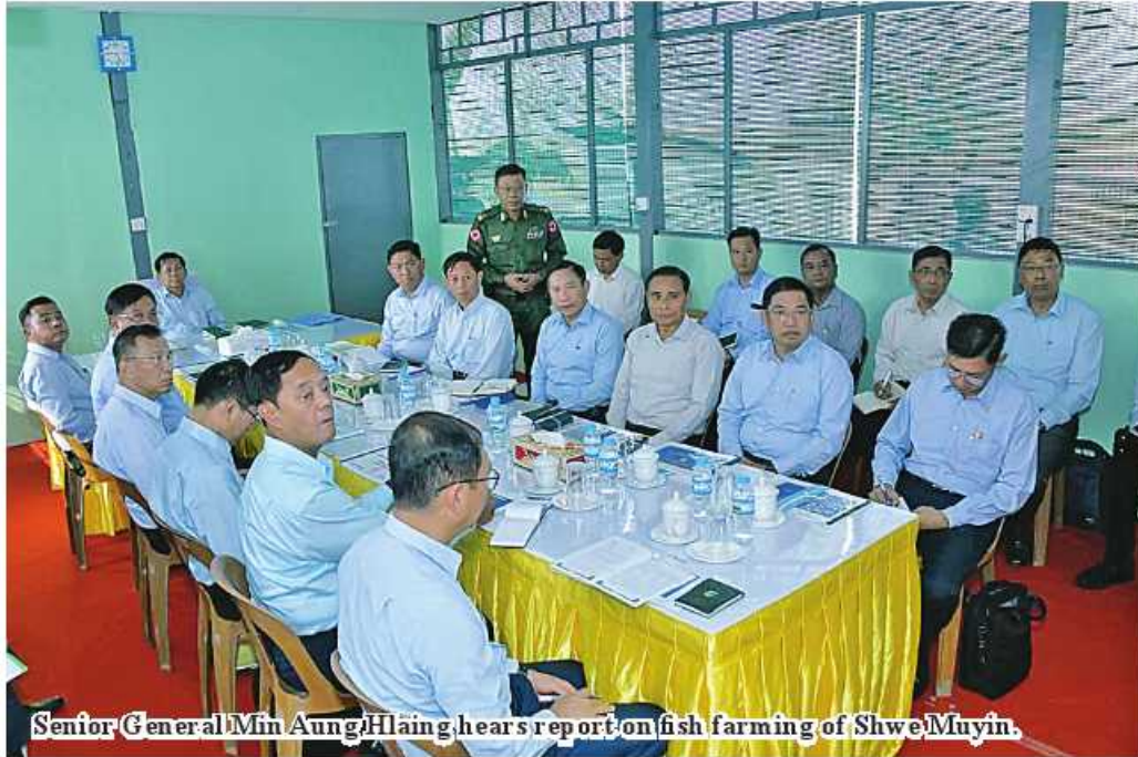
Senior General Min Aung Hlaing hears report on fish farming of Shwe Muyein.