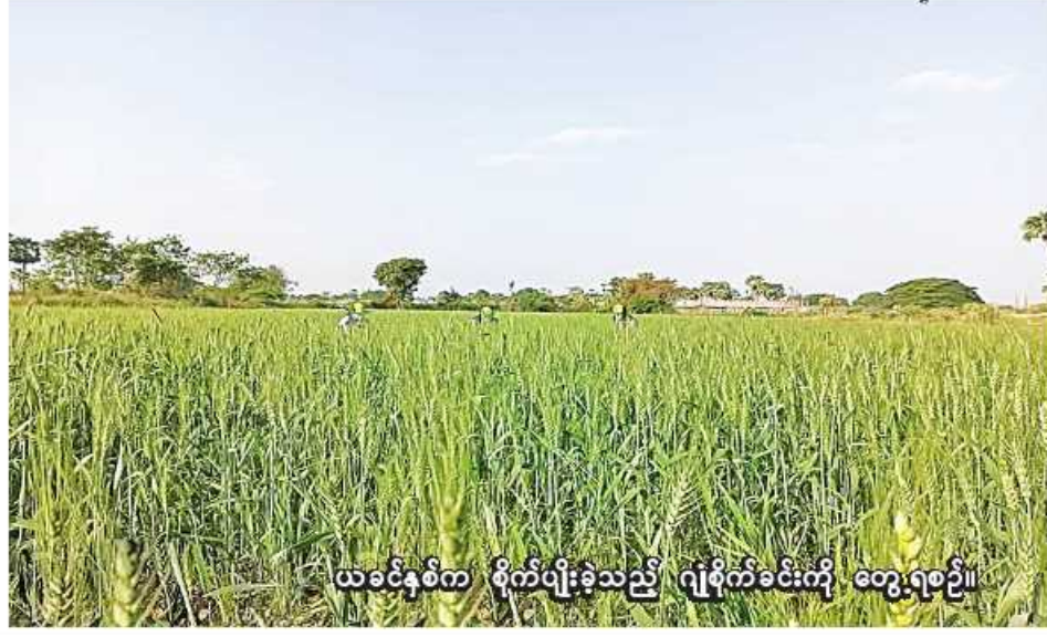
ယခင်နှစ်က စိုက်ပျိုးခဲ့သည့် ဂျုံစိုက်ခင်းကို တွေ့ရစဉ်။

ထွက်ရှိကြောင်း သိရသည်။ ပြီးခဲ့သည့် ဆောင်းသီးနှံစိုက်ပျိုးရာသီက ဝက်လက်မြို့နယ်တွင် ဂျုံသီးနှံ ၂၄၅၅၇ ဧက စိုက်ပျိုးနိုင်ခဲ့ကြောင်း ဝက်လက်မြို့နယ် စိုက်ပျိုးရေးဦးစီးဌာနမှ သိရသည်။ (၂၀၆)