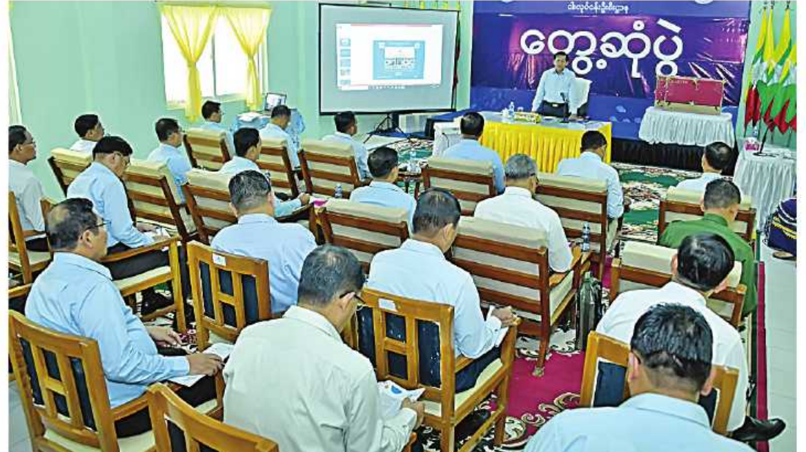
နိုင်ငံတော်စီမံအုပ်ချုပ်ရေးကောင်စီဥက္ကဋ္ဌ နိုင်ငံတော်ဝန်ကြီးချုပ် ဗိုလ်ချုပ်မှူးကြီးမင်းအောင်လှိုင် စိုက်ပျိုးရေး၊ မွေးမြူရေးနှင့် ဆည်မြောင်းဝန်ကြီးဌာန၊ ငါးလုပ်ငန်းဦးစီးဌာနလက်အောက်ရှိ ငါးလုပ်ငန်းသိပ္ပံ(တွဲတေး)မှ အုပ်ချုပ်မှုတာဝန်ခံများ၊ ဆရာ၊ ဆရာမများ၊ ကျောင်းသား၊ ကျောင်းသူများကို တွေ့ဆုံအမှာစကားပြောကြားစဉ်။

ဒေသတွင်းမှထွက်ရှိသည့် မွေးမြူရေး ထုတ်ကုန်များကို ဈေးကွက်သို့လျင်မြန်စွာ ရောက်ရှိစေရေးနှင့် ဈေးနှုန်းသက်သာစေ ရေးအတွက် သယ်ယူပို့ဆောင်ရေးသည် အရေးကြီးကြောင်း၊ ထုတ်ကုန်ကို ဈေးနှုန်းသက်သာစွာ ထုတ်လုပ်နိုင်သည် ဖြစ်သော်လည်း သယ်ယူပို့ဆောင်ရေး လမ်းကြောင်းရရှိရန်အတွက် ခက်ခဲခြင်းတို့ ကြောင့် စရိတ်များကြီးမြင့်လာနိုင်သဖြင့် ကုန်ထုတ်လုပ်မှုလမ်းကြောင်းကို ဆောင်