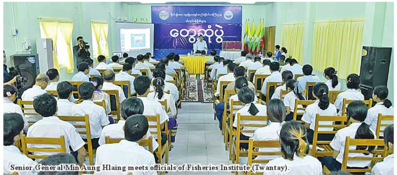
Senior General Min Aung Hlaing meets officials of Fisheries Institute (Twantay).

Muyein after processing by using cold storage vehicles. Fish breeding tasks must be systematic and contribute to regional residents. Then, the Senior Gen-