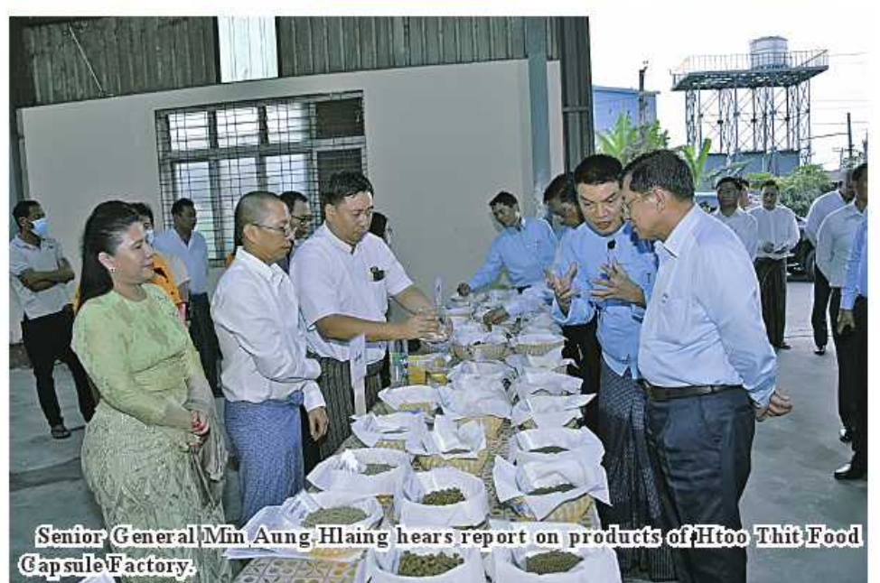
Senior General Min Aung Hlaing hears report on products of Htoo Thit Food Capsule Factory.