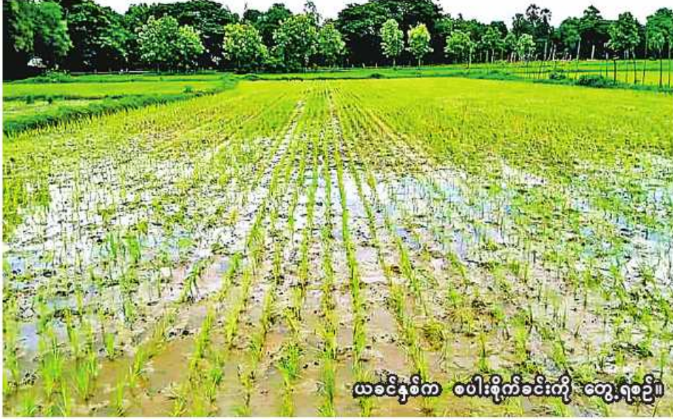
ယခင်နှစ်က စပါးစိုက်ခင်းကို တွေ့ရစဉ်။