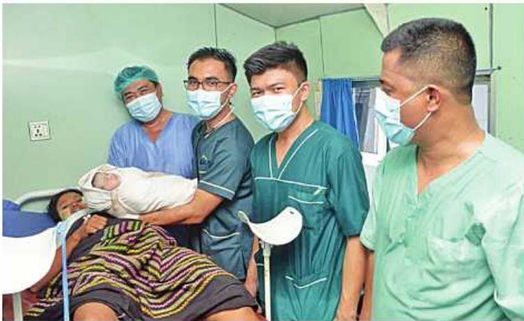
တပ်မတော်မြစ်တွင်းသွားဆေးရုံရေယာဉ်(ရွှေပုဇွန်)ပေါ်၌ တပ်မတော်နယ်လှည့် အထူးကုဆေးအဖွဲ့က သမီးမိန်းကလေးတစ်ဦးကို အောင်မြင်စွာမွေးဖွားပေးစဉ်။

အဆိုပါကလေးငယ်သည် ယခုခရီးစဉ် အတွင်း ပထမဆုံး မွေးဖွားပေးခဲ့သည့် ကလေးငယ်ဖြစ်ပြီး တပ်မတော်မြစ်တွင်းသွား ဆေးရုံရေယာဉ်(ရွှေပုဇွန်)၏ ၂၀၁၃ ခုနှစ် မှစ၍ ဆေးကုသမှုများပြုလုပ်ပေးမှုသမိုင်း မှတ်တမ်းတွင် ၂၅ ဦးမြောက်အဖြစ် အောင်မြင်စွာ မွေးဖွားပေးနိုင်ခဲ့ခြင်းဖြစ် ကြောင်း သတင်းရရှိသည်။