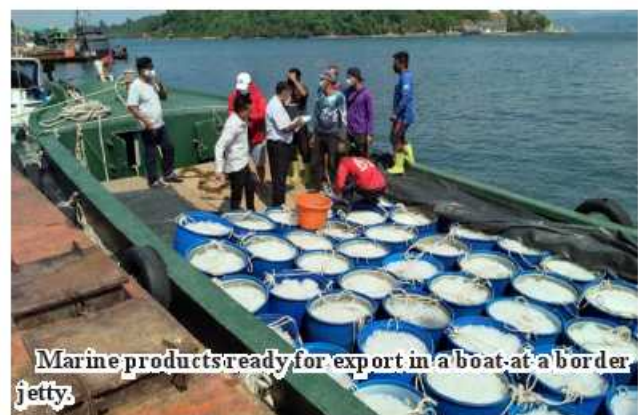
Marine products ready for export in a boat at a border jetty.

customer countries while emphasizing not decline of export volume of marine products due to the fact China restricts Covid-19 virus in the products. ASH