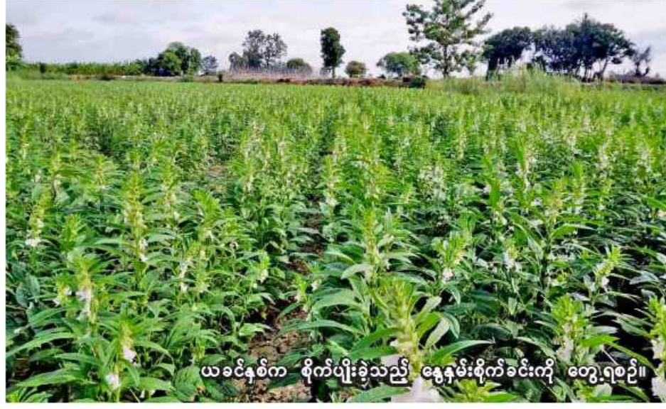
ယခင်နှစ်က စိုက်ပျိုးခဲ့သည့် နွေနှမ်းစိုက်ခင်းကို တွေ့ရစဉ်။