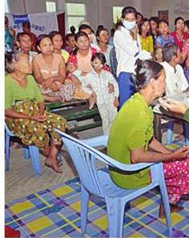
တပ်မတော်မြစ်တွင်းသွားဆေးရုံရေယာဉ်(ရွှေပုဇွန်)နှင့် မြစ်ရေယာဉ်(စက)တို့မှ လပွတ္တာမြို့နယ်အတွင်းရှိ ကျေးရွာများမှ ဒေသခံပြည်သူများကို ကျန်းမာရေး စောင့်ရှောက်မှုလုပ်ငန်းများဆောင်ရွက်ပေးစဉ်။