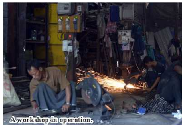
A workshop in operation.

factories not to cause boiler blast. So, our department's inspection tasks exceeds the target on a yearly basis." The department inspects lifts, escalators, generators, welders and installation of power cables at factories, workshops, hotels, supermarkets, public buildings and other structures in order to ensure electricity safety. If necessary, the department gives instructions and recommendations to these buildings. 185