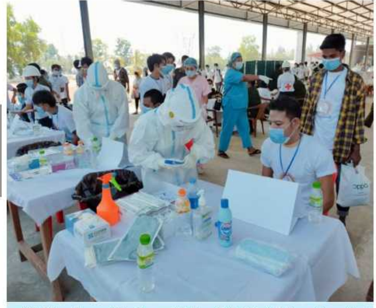
ထိုင်းနိုင်ငံတွင် ရောက်ရှိနေပြီး အကြောင်းအမျိုးမျိုးကြောင့် ပြန်လာရန်အခက်အခဲ ဖြစ်ပေါ်လျက်ရှိသောမြန်မာနိုင်ငံသားများကို မြို့နယ်ပြည်သူ့ဆေးရုံမှ ကျန်းမာရေး ဝန်ထမ်းများနှင့် နယ်မြေစတင်တပ်မတော်ဆေးကုသရေးအဖွဲ့တို့က ကျန်းမာရေး စစ်ဆေးပေးခြင်းများ ဆောင်ရွက်ပေးစဉ်။