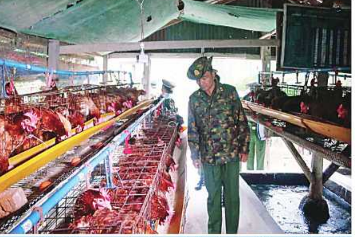
အနောက်ပိုင်းတိုင်းစစ်ဌာနချုပ် တိုင်းမှူး ဗိုလ်ချုပ်ထင်လတ်ဦး အမ်းတပ်နယ်ရှိ တပ်ရင်းတပ်ဖွဲ့များ၌ စားကြက်မွေးမြူထားရှိမှုကို ကြည့်ရှုစစ်ဆေးစဉ်။

နေပြည်တော် ဖေဖော်ဝါရီ ၂ ကိုဗစ်- ၁၉ ရောဂါ ဖြစ်ပွားမှုကြောင့် ရောဂါကာကွယ်ထိန်းချုပ်ကုသရေးလုပ်ငန်း များ ဆောင်ရွက်နေချိန်တွင် ဒေသတွင်း စားနပ်ရိက္ခာဖူလုံရေးနှင့် ပြည်သူများ၏ စားသောက်ရေးကို အထောက်အကူ ဖြစ်စေရန်အတွက် တိုင်းစစ်ဌာနချုပ်များ၊ တပ်ရင်း၊ တပ်ဖွဲ့များ၌ စိုက်ပျိုးမွေးမြူ ရေးလုပ်ငန်းများကို ဆောင်ရွက်လျက် ရှိသည်။