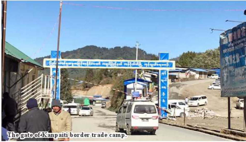
The gate of Kanpaiti border trade camp.

Myitkyina February 2 The Ministry of Commerce on 31 January 2023 stated that Kanpaiti border trade camp could earn trade surplus in 2022-23 fiscal year. The camp managed export and import processes as the fourth largest trade vol-