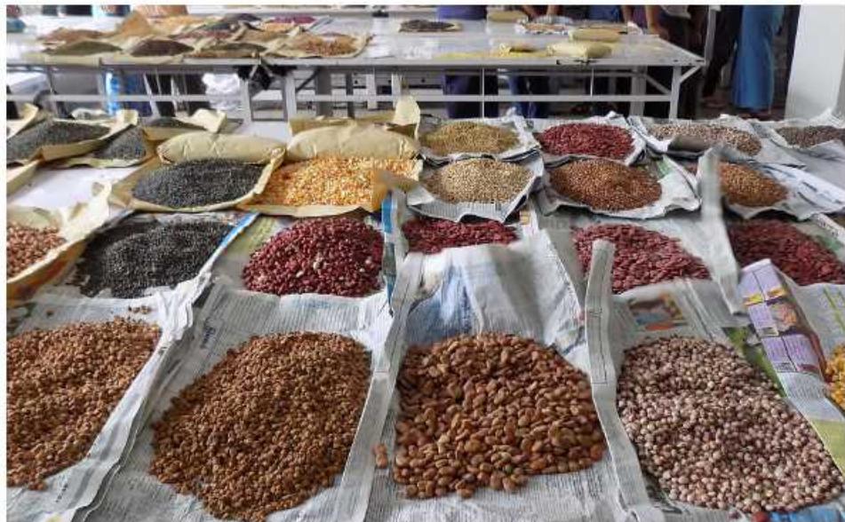
ရန်ကုန် ဖေဖော်ဝါရီ ၂

ယခုဘဏ္ဍာနှစ် ပြေ ၁ ရက်မှ ဇန်နဝါရီ ၃၁ ရက်ထိ ပြည်ပသို့ ပဲမျိုးစုံတင်ပို့မှုမှ အမေရိကန် ဒေါ်လာသန်း ၁၁၀၀ ရရှိထားကြောင်း မြန်မာနိုင်ငံ ပဲမျိုးစုံ၊ ပြောင်းနှင့် နှမ်းကုန်သည်များ အသင်း (ရန်ကုန်တိုင်းဒေသကြီး) ဝဟိုအလုပ်အမှုဆောင် ဦးသက်စုစုပေါင်းပဲမျိုးစုံတန်ချိန် ၁၂ ဒသမ