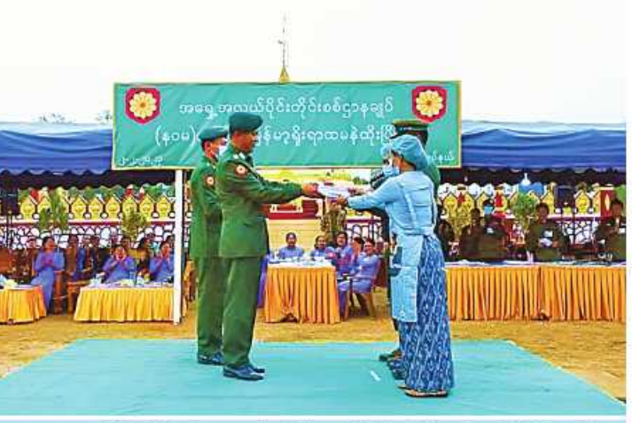
အရှေ့အလယ်ပိုင်းတိုင်းစစ်ဌာနချုပ် တိုင်းမှူး ဗိုလ်ချုပ်မှူးမင်းထွန်း မြန်မာ့ရိုးရာ ထမနဲထိုးပြိုင်ပွဲတွင် ဆုရရှိသည့်အသင်းများကို ဆုများပေးအပ်ချီးမြှင့်စဉ်။

ထိုသို့ကျင်းပပြုလုပ်လျက်ရှိရာ ဖေဖော် ဝါရီ ၁ ရက်နှင့် ယနေ့တို့တွင် အရှေ့ အလယ်ပိုင်းတိုင်းစစ်ဌာနချုပ်ရှိ မဟာ