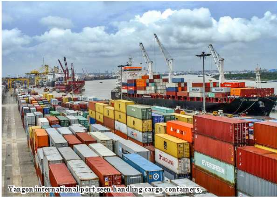
Yangon international port seen handling cargo containers.

Numbers of vessels from these international shipping lines will be nine vessels from New Golden Sea (COSCO), nine from Sea and Maersk ASIA, four from MSC line, three each from PIL, RC, Samudera shipping lines and SITC, TI2 Container Line, two each from BIPL line, Evergreen Line and X-press Feeder line, one each from Bay Line, CMA-SGM line, Gold Star line, IAL line and Land and two from Sea line MTT shipping line and one from RCL line.