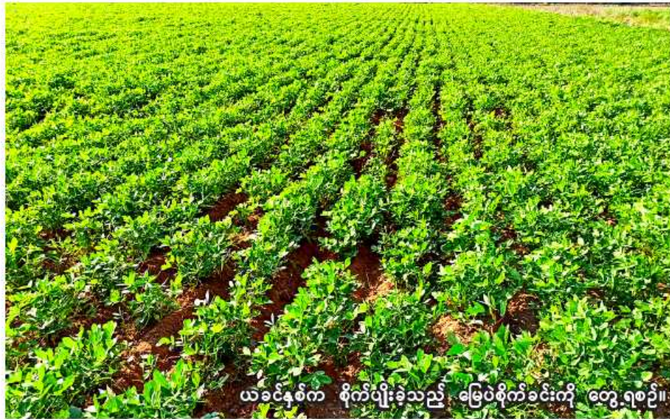
ယခင်နှစ်က စိုက်ပျိုးခဲ့သည့် မြေပဲစိုက်ခင်းကို တွေ့ရစဉ်။