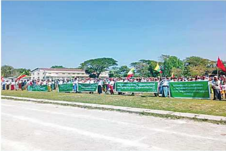
ရောဂါတိုင်းဒေသကြီး သာပေါင်းမြို့နယ်၌ နိုင်ငံတော်စီမံအုပ်ချုပ်ရေးကောင်စီ နှင့် မြန်မာ့တပ်မတော်ကို ထောက်ခံပွဲပြုလုပ်စဉ်။

ထိုသို့ဆန္ဒဖော်ထုတ်ရာတွင် "နိုင်ငံတော် စီမံအုပ်ချုပ်ရေးကောင်စီအစိုးရ၏ နှစ်နှစ် ပြည် အုပ်ချုပ်မှုကို ထောက်ခံပါသည်။ အမျိုးသားကာကွယ်ရေးနှင့် လုံခြုံရေး ကောင်စီကိုကြိုဆိုပါသည်။ အမျိုးဘာသာ၊ သာသနာစောင့်ရှောက်ရေး ဦးအရေး၊ NUG ၊ CRPH ၊ PDF အကြမ်းဖက်သမား များ အလိုမရှိ။ ပြည်တွင်း၊ ပြည်ပအဖျက် သမားမှန်သမျှ ဆန့်ကျင်ကြ။ ဗုဒ္ဓဘာသာ ရဟန်းတော်များအား ကာကွယ်ကြ၊ ရွေးကောက်ပွဲအောင်မြင်စွာကျင်းပနိုင်ရေး ဦးအရေး၊ ဖွဲ့စည်းပုံအခြေခံဥပဒေနှင့်အညီ