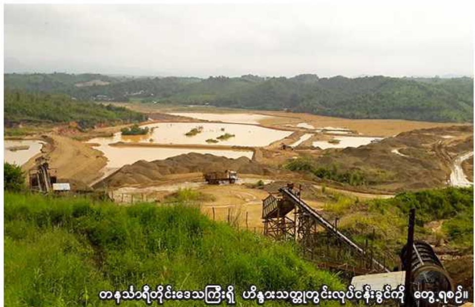
တနင်္သာရီတိုင်းဒေသကြီးရှိ ဟိန္ဒူးသတ္တုတွင်းလုပ်ငန်းခွင်ကို တွေ့ရစဉ်။

နေပြည်တော် ဖေဖော်ဝါရီ ၂ မှုး ဦးနန္ဒက ပြောပြ၍ သိရသည်။ ၂၀၂၂-၂၀၂၃ ဘဏ္ဍာနှစ် ဧပြီ ၁ ရက်မှ ဇန်နဝါရီ ၃၁ ရက်ထိ ကာလအတွင်း ပြည်ပသို့ သတ္တုနှင့် တွင်းထွက်ပစ္စည်းတင်ပို့မှုမှ အမေရိကန်ဒေါ်လာ ၂၃၅ ဒသမ ၄၇ သန်း ရရှိထားကြောင်း စီးပွားရေးနှင့် ကူးသန်းရောင်းဝယ်ရေးဝန်ကြီးဌာန ကုန်သွယ်ရေးဦးစီးဌာန ညွှန်ကြားရေး ဝန်ကြီးဌာနက ပြောပြသည်။