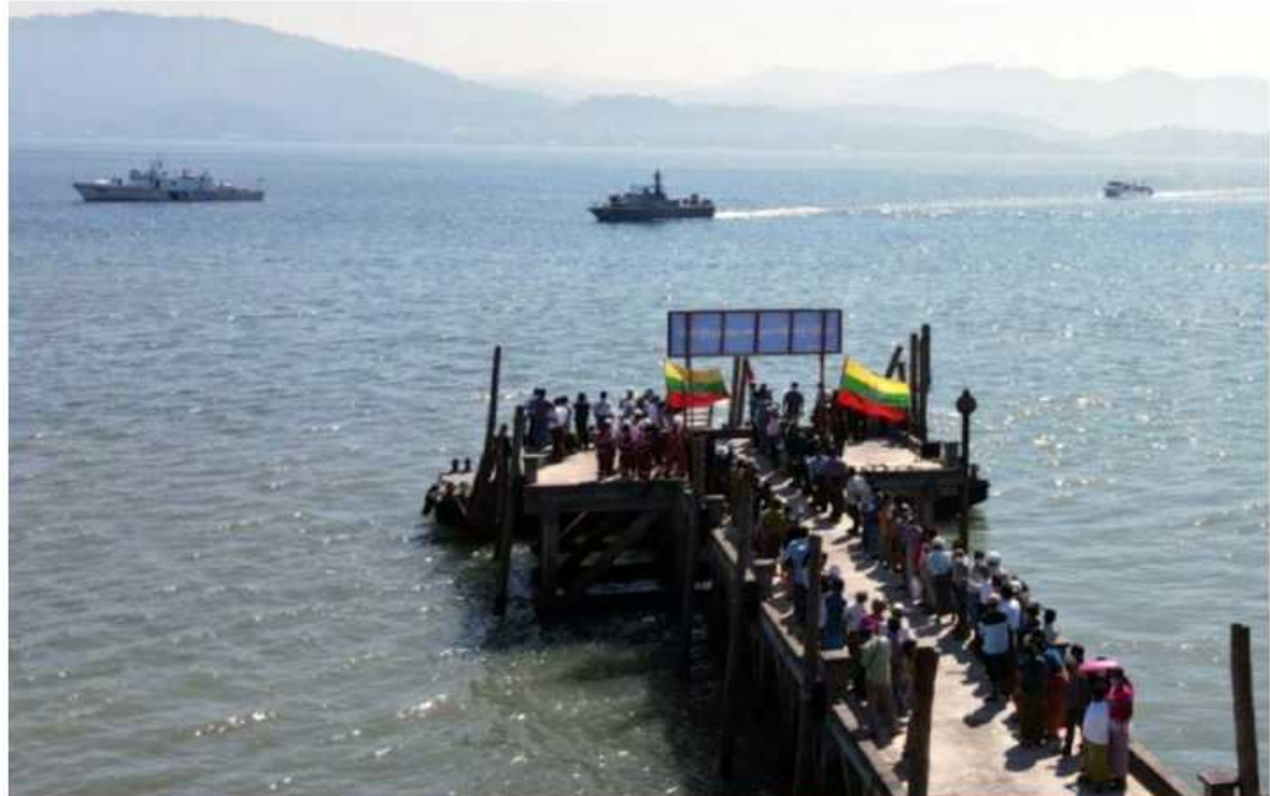
ထိုင်းနိုင်ငံတွင် ရောက်ရှိနေပြီး အကြောင်းအမျိုးမျိုးကြောင့် ပြန်လာရန် အခက်အခဲဖြစ်ပေါ်လျက်ရှိသော မြန်မာနိုင်ငံသား များ ကော့သောင်မြို့၊ ရွှေဝက်ပံဆိပ်ခံတံတားသို့ ပြန်လည်ရောက်ရှိစဉ်။