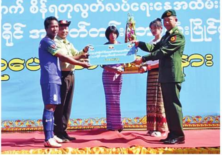
အရှေ့အလယ်ပိုင်းတိုင်းဓနိဋ္ဌာနချုပ် တိုင်းမှူး ဝိုင်းမျိုးချုပ်နှင့် ဝိုင်းဆုရရှိသည့် လှိုင်လင်မြို့နယ် (က)အသင်းကို ဆုပေးအပ်ချီးမြှင့်စဉ်။

နေပြည်တော် ဓနိဋ္ဌာနချုပ် ၃ (၇၅)နှစ်မြောက် စိန်ရတုလွတ်လပ်ရေး နေ့ကို ကြိုဆိုဂုဏ်ပြုသောအားဖြင့် လေးခရိုင်အလွတ်တန်း အမျိုးသားဘောလုံး ပြိုင်ပွဲ ပိတ်ပွဲနှင့်ဆုပေးပွဲတို့ကို ယနေ့ နေ့လယ်ပိုင်းတွင် ရှမ်းပြည်နယ်(တောင်ပိုင်း) နမ့်စန်မြို့ မြို့နယ်အားကစားကွင်း၌ပြုလုပ် ရာ အရှေ့အလယ်ပိုင်းတိုင်းစစ်ဌာနချုပ် တိုင်းမှူး ဝိုင်းမျိုးချုပ်နှင့် တာဝန် ရှိသူများ၊ ခရိုင်အဆင့်ဌာနဆိုင်ရာတာဝန် ရှိသူများ၊ ဌာနဆိုင်ရာဝန်ထမ်းများ၊ ကျောင်းသား၊ ကျောင်းသူများ၊ ပြိုင်ပွဲဝင် အသင်းများ၊ ခိုင်အဖွဲ့ဝင်များနှင့် အားကစား ဝါသနာရှင်များ တက်ရောက်ကြသည်။ ဦးစွာ အမျိုးသားဘောလုံးပြိုင်ပွဲ ဝိုင်းလှပွဲ ပွဲစဉ်များမစတင်မီ နိုင်ငံကျော် တေးသံရှင်များနှင့် ရှမ်း၊ လားဟူ၊ ပအိုဝ်း၊