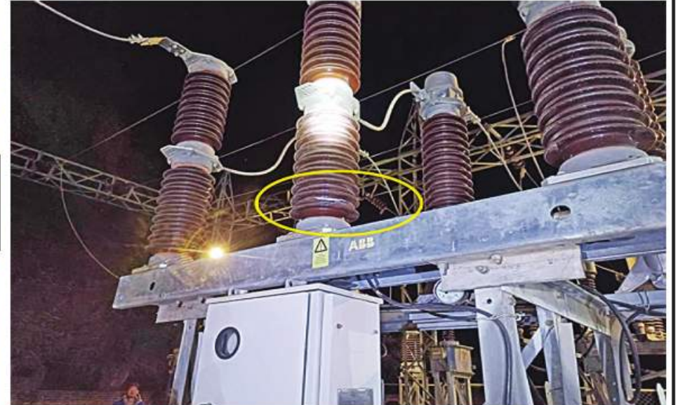
ကျောက်ပန်းတောင်းမြို့နယ် ၆၆/၁၁ ကေဗွီ ပိန္နဲတောဓာတ်အားခွဲရုံ ဝိုင်းအားပေးစက်ရုံပျက်စီးမှုမှတ်တမ်းဓာတ်ပုံ