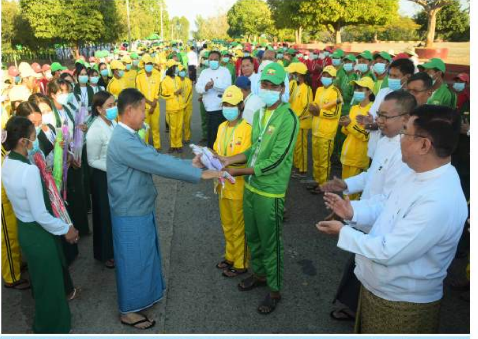
နိုင်ငံတော်စီမံအုပ်ချုပ်ရေးကောင်စီဒုတိယဥက္ကဋ္ဌ ဒုတိယဝန်ကြီးချုပ် ဒုတိယဗိုလ်ချုပ်မှူးကြီးစိုးဝင်း (၇၅)နှစ်မြောက် စိန်ရတုလွတ်လပ်ရေးနေ့ဂုဏ်ပြုအခမ်းအနားတွင် ပါဝင်ဆင်နွှဲကြမည့် ကျောင်းသား၊ ကျောင်းသူများနှင့် ရင်းရင်းနှီးနှီး တွေ့ဆုံအားပေးစကားပြောကြားသည်။