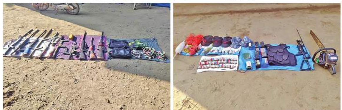
ခင်ဦးမြို့နယ် မြကန်ကျေးရွာရှိ အခြေခံပညာမူလတန်းကျောင်း(မြကန်)ကျောင်းဝင်းအတွင်း လက်နက်၊ ခဲယမ်းနှင့် ဆက်စပ်ပစ္စည်းများကို သိမ်းဆည်းရမိခဲ့သည့် မှတ်တမ်းဓာတ်ပုံ။

နေပြည်တော် ၈နိုဝင်ဘာ ၃ ခင်ဦးမြို့နယ် မြကန်ကျေးရွာရှိ အခြေခံပညာမူလတန်းကျောင်း၌ လက်လုပ်သေနတ်များနှင့် ဖောက်ခွဲရေးဆက်စပ်ပစ္စည်းများ သိမ်းဆည်းရမိခဲ့ကြောင်း မြန်မာနိုင်ငံရဲတပ်ဖွဲ့မှ သိရသည်။