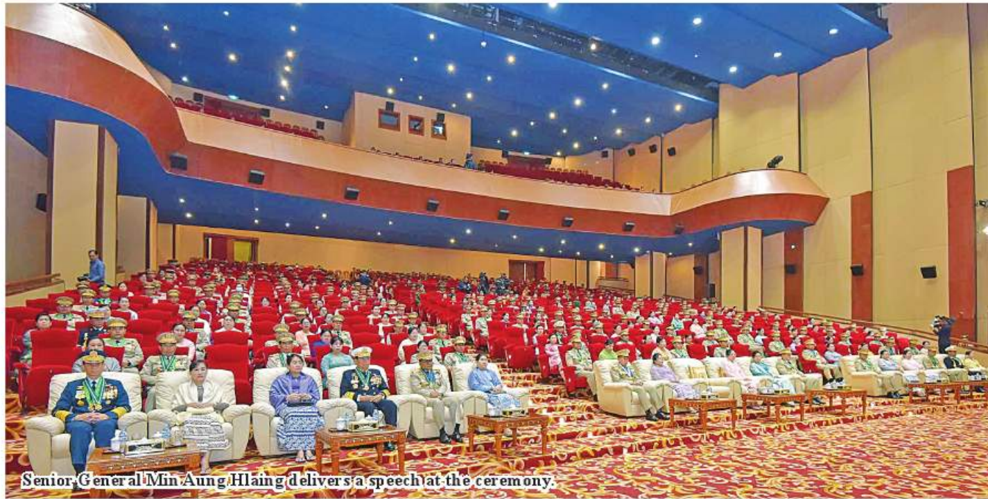
Senior General Min Aung Hlaing delivers a speech at the ceremony.