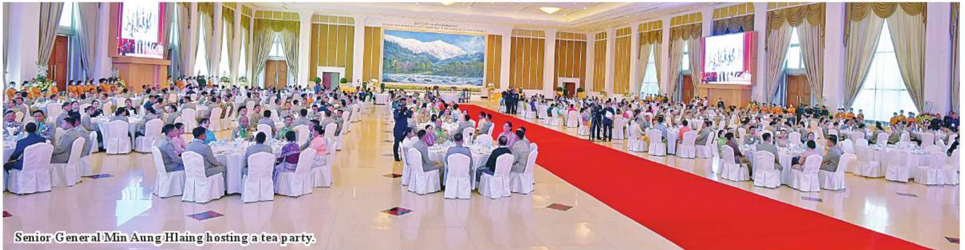
Senior General Min Aung Hlaing hosting a tea party.

Up to January 2022, the number of military gallantry medals and certificates winners totalled six Aung San Thuriya title winners, 51 Thiha Thura title winners, 554 Thura title winners, six Thiha Bala medal winners, 1860 gallantry record winners, 2,050 gallantry medal winners, 339 winners for gallantry certificate of the Supreme Commander, 3125 winners of gallantry certificate of the Commander-in-Chief of Defence Services, nine winners of honorary certificate of the Supreme Commander and 2351 winners winners of honorary certificate of the Commander-in-Chief of Defence Services. 100