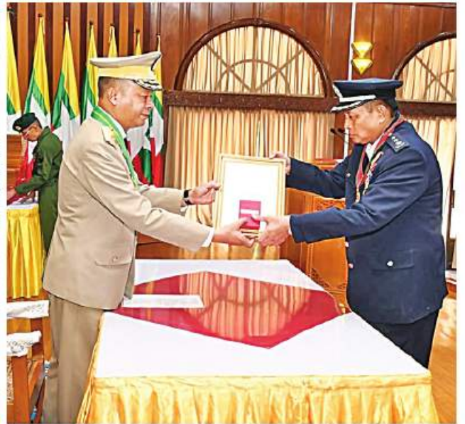
ရန်ကုန်တိုင်းစစ်ဌာနချုပ်၌ တပ်မတော်စွမ်းရည်သတ္တိဆိုင်ရာ ဂုဏ်ထူးဆောင်ဘွဲ့တံဆိပ်နှင့် လက်မှတ်များ ပေးအပ်ချီးမြှင့်ခြင်း အခမ်းအနားကျင်းပစဉ်။

နေပြည်တော် ဇန်နဝါရီ ၃ တပ်မတော် စွမ်းရည်သတ္တိဆိုင်ရာ ဂုဏ်ထူးဆောင်ဘွဲ့တံဆိပ်နှင့် လက်မှတ်များ ပေးအပ်ချီးမြှင့်ခြင်းအခမ်းအနားများကို ယနေ့နံနက်ပိုင်းတွင် တိုင်းစစ်ဌာနချုပ်အသီးသီး၌ တစ်ချိန်တည်း တစ်ပြိုင်တည်း အသီးသီးကျင်းပပြုလုပ်ကြရာ သက်ဆိုင်ရာ တိုင်းစစ်ဌာနချုပ်များမှ တိုင်းမှူးများ၊ တပ်မတော်အရာရှိကြီးများ၊ အရာရှိ၊ စစ်သည်၊ မိသားစုများ၊ ဂုဏ်ထူးဆောင်ဘွဲ့တံဆိပ် ချီးမြှင့်ခြင်းခံရသူများနှင့် မိဘဆွေမျိုးများ၊ ဖိတ်ကြားထားသူများ တက်ရောက်ကြသည်။ ဦးစွာ တိုင်းမှူးများက ဂုဏ်ပြုအမှာစကားများ အသီးသီးပြောကြားကြသည်။ ထို့နောက် တပ်မတော်စွမ်းရည်သတ္တိဆိုင်ရာ ဂုဏ်ထူးဆောင်ဘွဲ့တံဆိပ်နှင့် လက်မှတ်များ ရရှိကြသူများကို နိုင်ငံတော်စီမံ