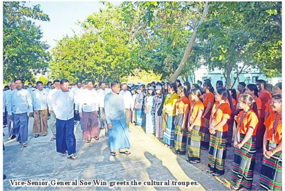
Vice-Senior General Soe Win greets the cultural troupes.