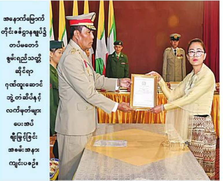
တံဆိပ်နှင့် ဂုဏ်ပြုလက်မှတ်များ အသီးသီး ဓာတ်ပုံရိုက်ခဲ့ကြကြောင်း သတင်းရပေးအပ်ချီးမြှင့်ကြပြီး အမှတ်တရစုပေါင်း ရှိသည်။