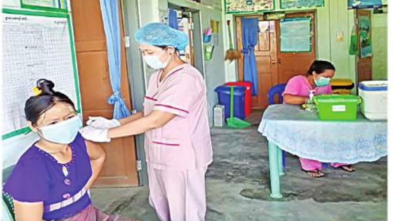
ရောဂါတိုင်းဒေသကြီး ကျောင်းကျန်းမြို့၌ ဒေသခံပြည်သူများကို ကိုဗစ်-၁၉ ရောဂါကာကွယ်ဆေးထိုးနှံပေးစဉ်။

နေပြည်တော် ဇန်နဝါရီ ၃ ကိုဗစ်-၁၉ ရောဂါ ကာကွယ် ထိန်းချုပ်၊ ကုသရေးဆောင်ရွက်ရာတွင် ကာကွယ်ဆေးထိုးနှံခြင်းသည် အဓိကအခန်းကဏ္ဍတွင် ပါဝင်သည့် လုပ်ငန်းတစ်ရပ်ဖြစ်သောကြောင့် တိုင်းဒေသကြီးနှင့် ပြည်နယ်အသီးသီးတို့၌ ကာကွယ်ဆေးထိုးနှံခြင်းကို အင်တိုက်အားတိုက်ဆောင်ရွက်လျက်ရှိရာ ဇန်နဝါရီ ၂ ရက်နှင့် ယနေ့တို့တွင် ရောဂါတိုင်း