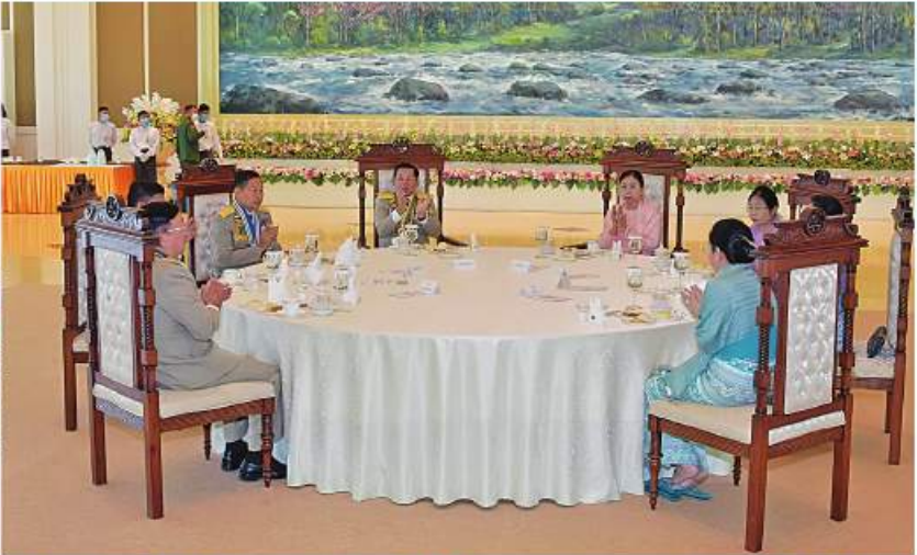
နိုင်ငံတော်စီမံအုပ်ချုပ်ရေးကောင်စီဥက္ကဋ္ဌ တပ်မတော်ကာကွယ်ရေးဦးစီးချုပ် ဝင်းထွန်း၊ သတိုးမဟာသရေစည်သူ သတိုးသီရိသုဓမ္မ မင်းအောင်လှိုင်နှင့်ဧည့်သည်အဖွဲ့ဝင်များက တပ်မတော်စွမ်းရည်သတ္တိဆိုင်ရာ ဂုဏ်ထူးဆောင်တံဆိပ်နှင့် လက်မှတ်များချီးမြှင့်ခံရသူများကို ရင်းနှီးနှေးနှေးစွာနှုတ်ဆက်စဉ်။

အဖွဲ့က တေးသီချင်းများဖြင့် ဂုဏ်ပြု ဖော်ပြကြသည်။ အခမ်းအနားအပြီးတွင် နိုင်ငံတော်စီမံအုပ်ချုပ်ရေးကောင်စီဥက္ကဋ္ဌ တပ်မတော်ကာကွယ်ရေးဦးစီးချုပ်နှင့် အဖွဲ့ဝင်များသည် တပ်မတော်စွမ်းရည်သတ္တိဆိုင်ရာ ဂုဏ်ထူးဆောင်တံဆိပ်နှင့် လက်မှတ်များ ချီးမြှင့်ခံရသူများကို ရင်းနှီးနှေးနှေးစွာနှုတ်ဆက်သည်။ တပ်မတော်တွင် စွမ်းရည်သတ္တိဆိုင်ရာ ဂုဏ်ထူးဆောင်တံဆိပ်နှင့် လက်မှတ်ရရှိသူများအနေဖြင့် ၂၀၂၂ ခုနှစ် ဇန်နဝါရီလအထိ အောင်ဆန်းသူရိယဘွဲ့ ရရှိသူ ၅၁ ဦး၊ သူရဘွဲ့ရရှိသူ ၅၅၄ ဦး၊ သီဟဝလ တံဆိပ်ရရှိသူ ၅၁၅ ဦး၊ သူရဲကောင်း မှတ်တမ်းဝင်ရရှိသူ ၁၈၆၀၊ သူရဲကောင်း မှတ်တမ်းဝင်တံဆိပ်ရရှိသူ ၂၀၅၀၊ စစ်သေနာပတိချုပ်၏ သူရဲကောင်းလက်မှတ်ရရှိသူ ၃၃၉ ဦး၊ တပ်မတော် ကာကွယ်ရေးဦးစီးချုပ်၏