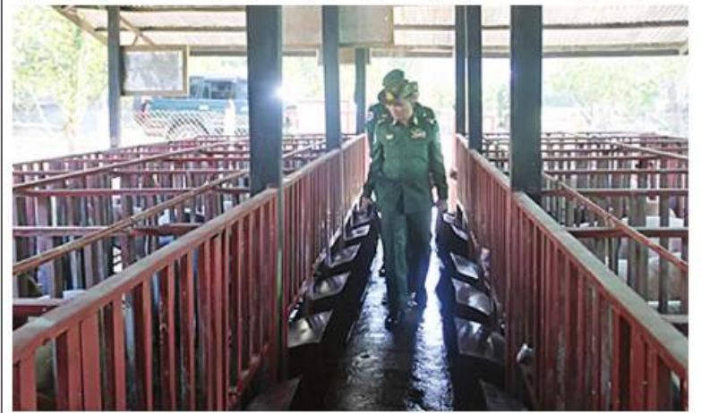
အနောက်ပိုင်းတိုင်းစစ်ဌာနချုပ် တိုင်းမှူး ဗိုလ်ချုပ်ထင်လတ်ဦး တိုင်းစစ်ဌာနချုပ်ပေါင်းစည်းလယ်ယာရီ DYL ဝက်မွေးမြူရေးရုံများကို ကြည့်ရှုစစ်ဆေးစဉ်

နေပြည်တော် ဇန်နဝါရီ ၃ ကိုဗစ်-၁၉ ရောဂါ ဖြစ်ပွားမှုကြောင့် ရောဂါကာကွယ်၊ ထိန်းချုပ်၊ ကုသရေးလုပ်ငန်းများ ဆောင်ရွက်နေချိန်တွင် ဒေသတွင်းစားနပ်ရိက္ခာဖူလုံရေးနှင့် ပြည်သူများ၏စားသောက်ရေးကို အထောက်အကူဖြစ်စေရန်အတွက် တိုင်းစစ်ဌာနချုပ်များ၊ တပ်ဖွဲ့များ၌ စိုက်ပျိုး၊ မွေးမြူရေးလုပ်ငန်းများကို ဆောင်ရွက်လျက်ရှိသည်။ ထိုသို့ ဆောင်ရွက်လျက်ရှိရာ ယနေ့ နံနက်ပိုင်းတွင် အနောက်ပိုင်းတိုင်းစစ်ဌာနချုပ် တိုင်းမှူး ဗိုလ်ချုပ်ထင်လတ်ဦးနှင့် တာဝန်ရှိသူများက တိုင်းစစ်ဌာနချုပ်ပေါင်းစည်းလယ်ယာစိုက်ပျိုးမွေးမြူရေးခြံတွင် DYL ဝက်၊ အသားစားကြက်၊ ဥစားကြက်နှင့် နို့စားနွားမွေးမြူရေးခြံများ၊ ကီလိုမာလကာ၊ ကျွဲကော၊ တစ်သျှူးငှက်ပျောနှင့် ဟော်လန်သံပရာစိုက်ခင်းများကို သွားရောက်ကြည့်ရှုစစ်ဆေးပြီး တာဝန်ရှိသူများနှင့်တွေ့ဆုံကာ ကုန်ထုတ်လုပ်မှုလုပ်ငန်းများ ရာနှုန်းပြည့်ဆောင်ရွက်နိုင်ရေးနှင့် လိုအပ်သည်များ ပေါင်းစပ်ညှိနှိုင်းဆောင်ရွက်ပေးခဲ့ကြောင်း သတင်းရရှိသည်။