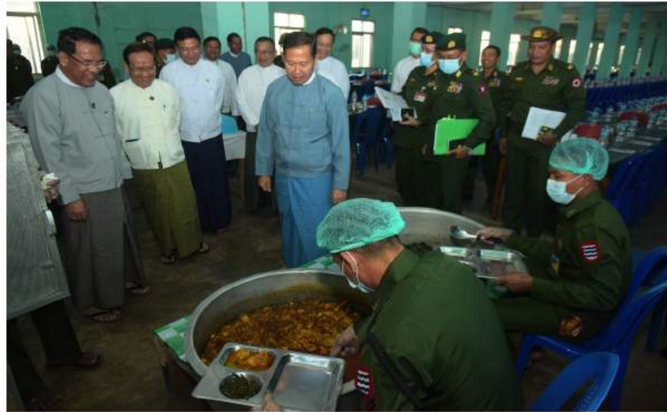
နိုင်ငံတော်စီမံအုပ်ချုပ်ရေးကောင်စီဒုတိယဥက္ကဋ္ဌ ဒုတိယဝန်ကြီးချုပ် ဒုတိယဗိုလ်ချုပ်မှူးကြီးစိုးဝင်း ကျောင်းသား၊ ကျောင်းသူများတည်းခိုနေထိုင်သည့်အိပ်ခန်းဆောင်များနှင့်စားရိပ်သာတို့ကို လှည့်လည်ကြည့်ရှု စစ်ဆေးစဉ်။