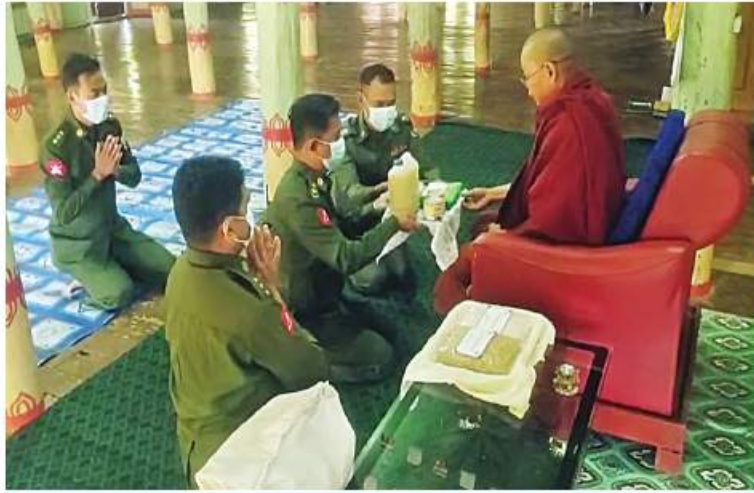
အမ်းမြို့ရှိ ကျောက်ကြီးဘုန်းတော်ကြီးကျောင်းဆရာတော်ထံ အနောက်ပိုင်းတိုင်း ဓနိဋ္ဌာနချုပ်မှ တာဝန်ရှိသူများက ဆန်၊ ဆီ၊ ဆား၊ ပဲ အမည်လေးမျိုးနှင့် လှူဖွယ် ပစ္စည်းများ ဆက်ကပ်လှူဒါန်းစဉ်။

နေပြည်တော် ဓနိဋ္ဌာနချုပ် ၃ ကိုဗစ်-၁၉ ရောဂါ ကြိုတင်ကာကွယ်ရေး လုပ်ငန်းများ ဆောင်ရွက်နေသည့်ကာလ အတွင်း ဆွမ်းကိစ္စရပ်များ အဆင်ပြေစေရန် ရည်ရွယ်၍ တပ်မတော်(ကြည်း၊ ရေ၊ လေ) အရာရှိ၊ စစ်သည်၊ အရာထမ်း၊ အမှုထမ်း