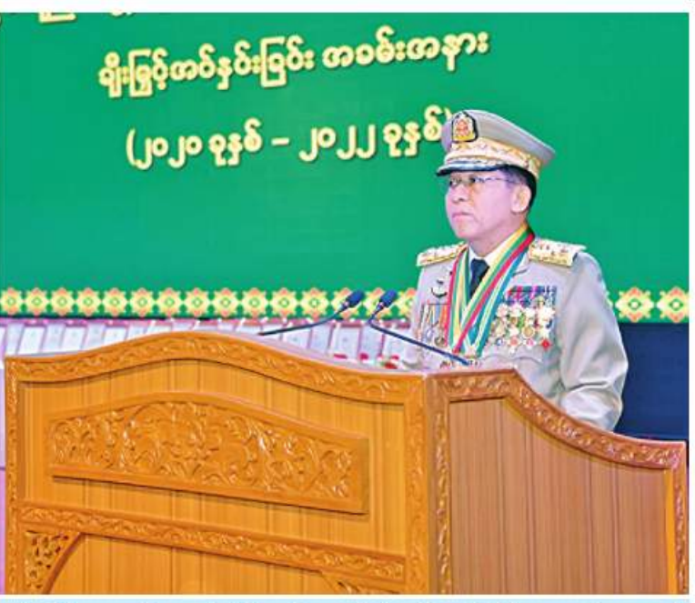
နိုင်ငံတော်စီမံအုပ်ချုပ်ရေးကောင်စီဥက္ကဋ္ဌ တပ်မတော်ကာကွယ်ရေးဦးစီးချုပ် ဗိုလ်ချုပ်မှူးကြီး သတိုးမဟာသရေစည်သူ သတိုးသီရိသုဓမ္မမင်းအောင်လှိုင် တပ်မတော်စွမ်းရည်သတ္တိဆိုင်ရာ ဂုဏ်ထူးဆောင်တံဆိပ်နှင့် လက်မှတ်များ ချီးမြှင့်အပ်နှင်းခြင်းအခမ်းအနားတွင် ဂုဏ်ပြုအမှာစကားပြောကြားစဉ်။