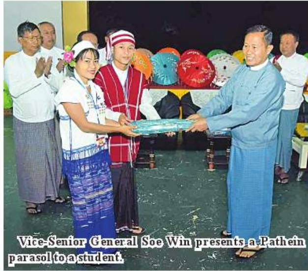
Vice-Senior General Soe Win presents a Pathien parasol to a student.