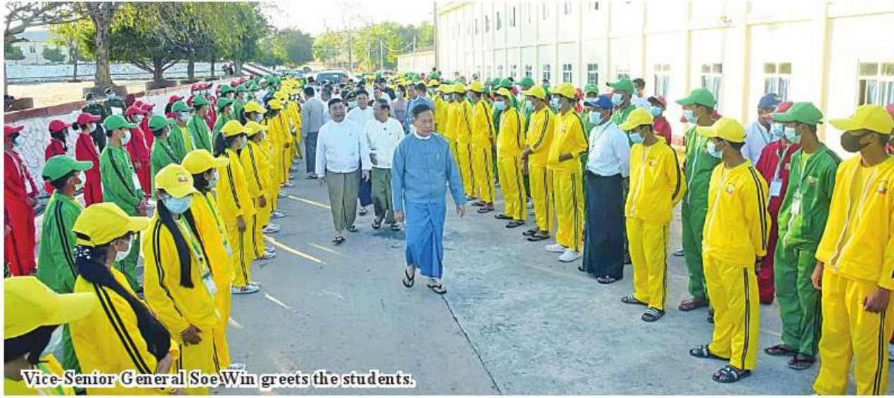
Vice-Senior General Soe Win greets the students.

Nay Pyi Taw January 3 Vice Chairman of the State Administration Council Deputy Prime Minister Vice-Senior General Soe Win visited and cordially