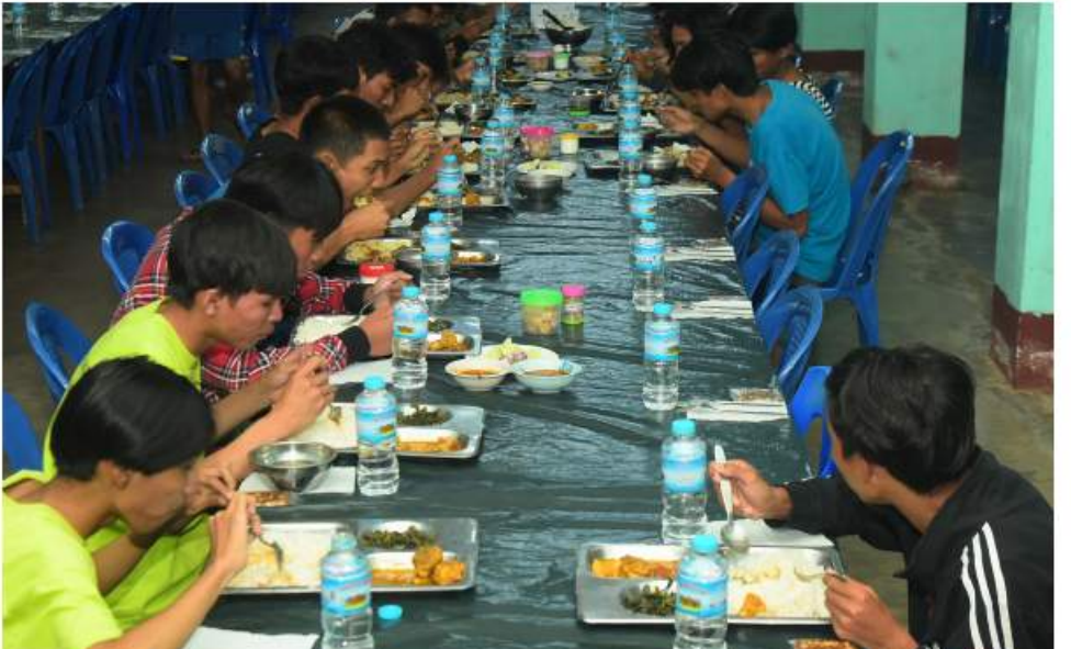
(၇၅)နှစ်မြောက် စိန်ရတုလွတ်လပ်ရေးနေ့ဂုဏ်ပြုအခမ်းအနားတွင် ပါဝင်ဆင်နွှဲကြမည့် ကျောင်းသား၊ ကျောင်းသူများ ညစာသုံးဆောင်နေမှုကိုတွေ့ရစဉ်။