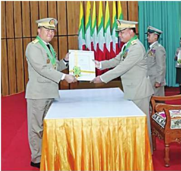
နေပြည်တော်တိုင်းစစ်ဌာနချုပ်၌ တပ်မတော်စွမ်းရည်သတ္တိဆိုင်ရာ ဂုဏ်ထူးဆောင်ဘွဲ့တံဆိပ်နှင့် လက်မှတ်များ ပေးအပ်ချီးမြှင့်ခြင်း အခမ်းအနားကျင်းပစဉ်။