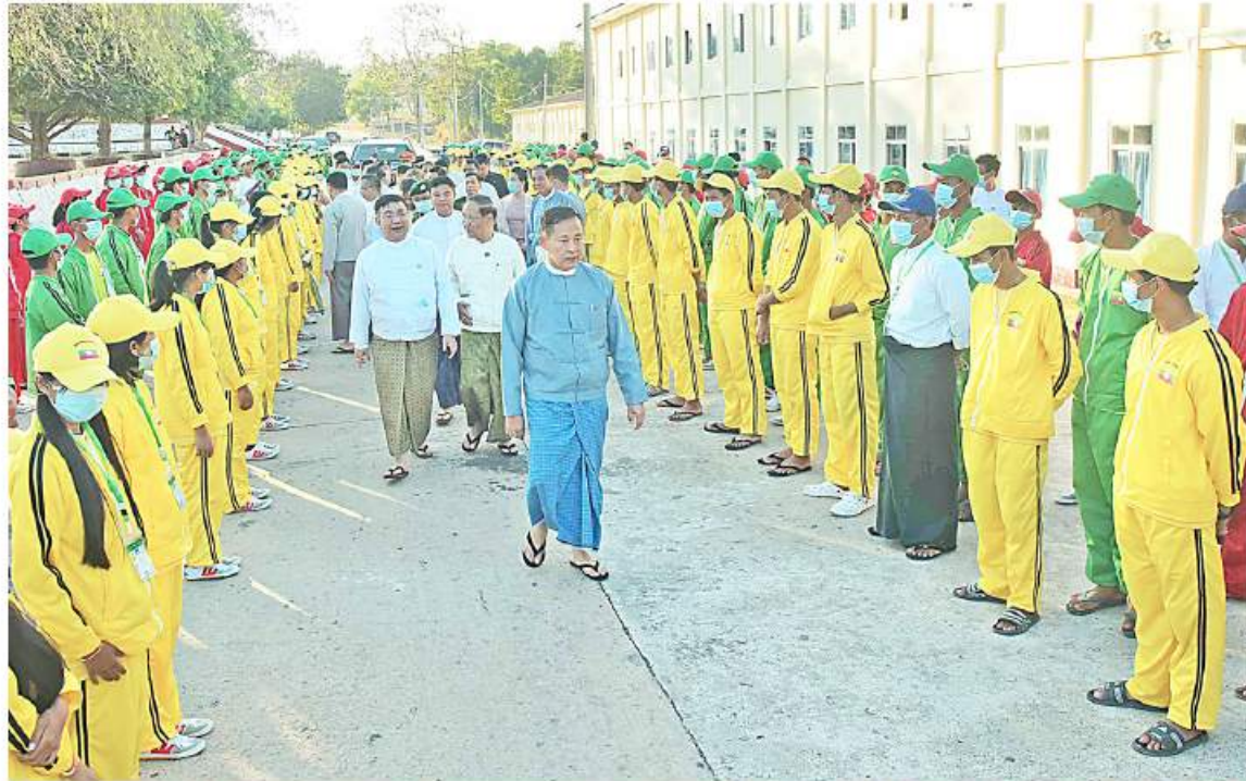
နိုင်ငံတော်စီမံအုပ်ချုပ်ရေးကောင်စီဒုတိယဥက္ကဋ္ဌ ဒုတိယဝန်ကြီးချုပ် ဒုတိယဗိုလ်ချုပ်မှူးကြီးစိုးဝင်း (၇၅)နှစ်မြောက် စိန်ရတုလွတ်လပ်ရေးနေ့ဂုဏ်ပြုအခမ်းအနားတွင် ပါဝင်ဆင်နွှဲကြမည့် ကျောင်းသား၊ ကျောင်းသူများကို ရင်းရင်းနှီးနှီးသွားရောက် တွေ့ဆုံအားပေးစဉ်။