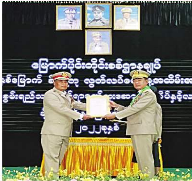
မြောက်ပိုင်းတိုင်းစစ်ဌာနချုပ်၌ တပ်မတော်စွမ်းရည်သတ္တိဆိုင်ရာ ဂုဏ်ထူးဆောင်ဘွဲ့တံဆိပ်နှင့် လက်မှတ်များ ပေးအပ်ချီးမြှင့်ခြင်း အခမ်းအနားကျင်းပစဉ်။