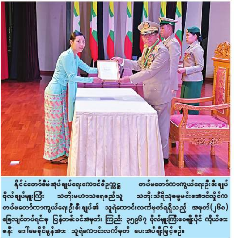
နိုင်ငံတော်စီမံအုပ်ချုပ်ရေးကောင်စီဥက္ကဋ္ဌ တပ်မတော်ကာကွယ်ရေးဦးစီးချုပ် ဝင်းထွန်း၊ သတိုးမဟာသရေစည်သူ သတိုးသီရိသုဓမ္မမင်းအောင်လှိုင်က တပ်မတော်ကာကွယ်ရေးဦးစီးချုပ်၏ ဂုဏ်ထူးဆောင်လက်မှတ်ရရှိသည့် အမှတ်(၁၅) ဖြေမြန်တပ်ရင်းမှ ကိုယ်ပိုင်အမှတ်၊ တ-၃၁၉၈၀၄ ဒုတိယတပ်ကြပ် သာသနာ့အောင် ကိုယ်စား ဇနီး ဒေါ်ခင်အေး ရုတ်ထူးဆောင်လက်မှတ် ပေးအပ်ချီးမြှင့်စဉ်။