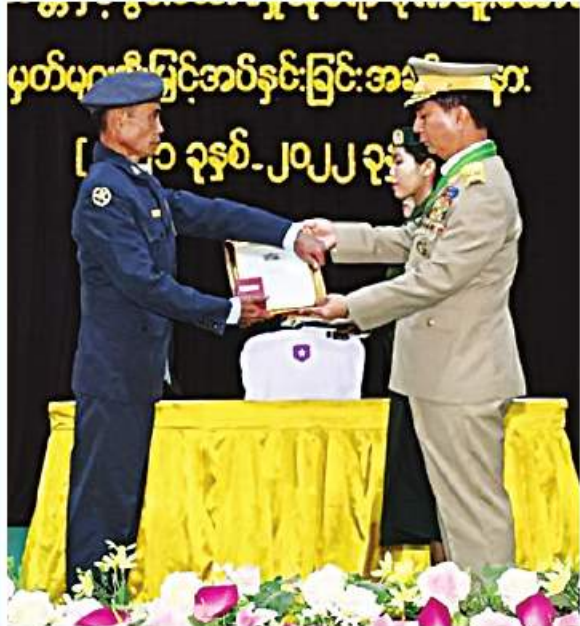
အုပ်ချုပ်ရေးကောင်စီဥက္ကဋ္ဌ တပ်မတော်များနှင့် တာဝန်ရှိသူများက တပ်မတော်ကာကွယ်ရေးဦးစီးချုပ်ကိုယ်စား တိုင်းမှူးစွမ်းရည်သတ္တိဆိုင်ရာ ဂုဏ်ထူးဆောင်ဘွဲ့

အလယ်ပိုင်းတိုင်း စစ်ဌာနချုပ်၌ တပ်မတော် စွမ်းရည်သတ္တိဆိုင်ရာ ဂုဏ်ထူးဆောင်ဘွဲ့တံဆိပ်နှင့် လက်မှတ်များ ပေးအပ်ချီးမြှင့်ခြင်း အခမ်းအနားကျင်းပစဉ်။