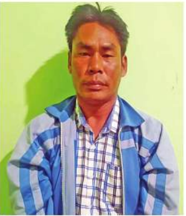
တရားခံ ကျော်မျိုးသူ