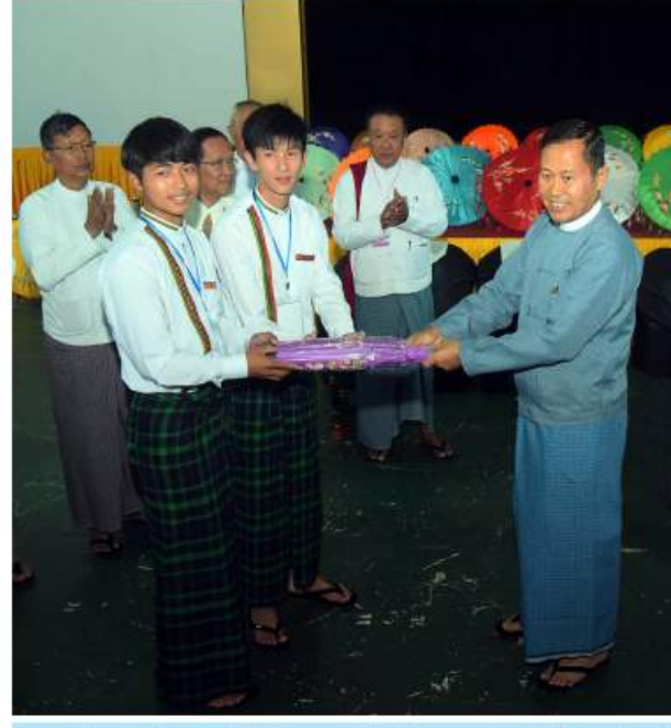
နိုင်ငံတော်စီမံအုပ်ချုပ်ရေးကောင်စီဒုတိယဥက္ကဋ္ဌ ဒုတိယဝန်ကြီးချုပ် ဒုတိယဗိုလ်ချုပ်မှူးကြီးစိုးဝင်း (၇၅)နှစ်မြောက် စိန်ရတုလွတ်လပ်ရေးနေ့ဂုဏ်ပြုအခမ်းအနားတွင် ပါဝင်ဆင်နွှဲကြမည့် ကျောင်းသား၊ ကျောင်းသူများကို ပုသိမ်တီးများအမှတ်တရလက်ဆောင်ပေးအပ်စဉ်။

နေပြည်တော် ဇန်နဝါရီ ၃ နိုင်ငံတော်စီမံအုပ်ချုပ်ရေးကောင်စီ ဒုတိယဥက္ကဋ္ဌ ဒုတိယဝန်ကြီးချုပ် ဒုတိယဗိုလ်ချုပ်မှူးကြီးစိုးဝင်းသည် ယနေ့ညနေပိုင်းတွင် (၇၅)နှစ်မြောက် စိန်ရတုလွတ်လပ်ရေးနေ့ဂုဏ်ပြုအခမ်းအနားတွင် ပါဝင်ဆင်နွှဲကြမည့် နေပြည်တော်အားကစားလေ့ကျင့်ရေးစခန်း၌ တည်းခိုနေထိုင်ကြသော တိုင်းဒေသကြီးနှင့် ပြည်နယ်များမှ တိုင်းရင်းသားရိုးရာ ယဉ်ကျေးမှုအဖွဲ့များနှင့် စစ်ကြောရေးနှင့် တည်းခိုရေးစခန်း(ရွာတော်)၌ တည်းခိုနေထိုင်ကြသော ကျောင်းသား၊ ကျောင်းသူများကို ရင်းရင်းနှီးနှီး သွားရောက်တွေ့ဆုံအားပေးသည်။ ဦးစွာ နိုင်ငံတော်စီမံအုပ်ချုပ်ရေးကောင်စီ ဒုတိယဥက္ကဋ္ဌ ဒုတိယဝန်ကြီးချုပ် ဒုတိယဗိုလ်ချုပ်မှူးကြီးစိုးဝင်းသည် နေပြည်တော်အားကစားလေ့ကျင့်ရေးစခန်း Gold Medal Hall သို့ရောက်ရှိပြီး တိုင်းဒေသကြီးနှင့် ပြည်နယ်များမှ တိုင်းရင်းသားရိုးရာ ယဉ်ကျေးမှုအဖွဲ့များ