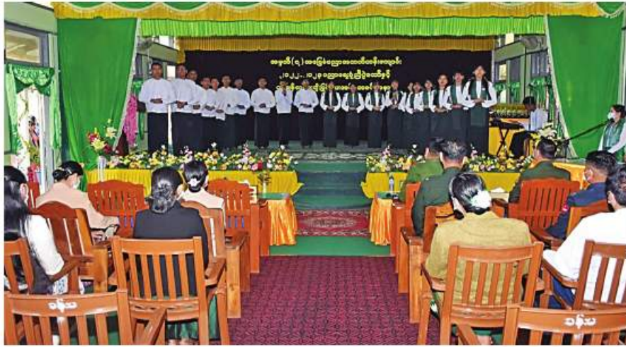
ပုသိမ်မြို့ရှိ အမှတ်(၇) အခြေခံပညာ အထက်တန်းကျောင်းတွင် ၂၀၂၂-၂၀၂၃ ပညာသင်နှစ် ပညာရေးစုံညီပွဲတော်နှင့် ထူးချွန်ဆုများပေးအပ်ပွဲ ကျင်းပစဉ်။

များကို တာဝန်ရှိသူများက ဂုဏ်ပြုမှတ်တမ်း လွှာနှင့် ဂုဏ်ပြုဆုငွေများ အသီးသီးပေးအပ် ချီးမြှင့်ခဲ့ပြီး ကျောင်းသား၊ ကျောင်းသူများက တေးသရုပ်ဖော်များဖြင့် သီဆိုကပြဖျော်ဖြေ နေမှုများကို ကြည့်ရှုအားပေးခဲ့ကြသည်။ ယင်းနောက် တိုင်းမှူးနှင့် တာဝန်ရှိသူများက ခန်းမအတွင်း ခင်းကျင်းပြသထားသည့် သင်ထောက်ကူပစ္စည်းများနှင့် နံရံကပ် စာစောင်များကို လိုက်လံကြည့်ရှု၍ လိုအပ်သည်များ ညှိနှိုင်းဆောင်ရွက်ပေးခဲ့ ကြကြောင်း သတင်းရရှိသည်။