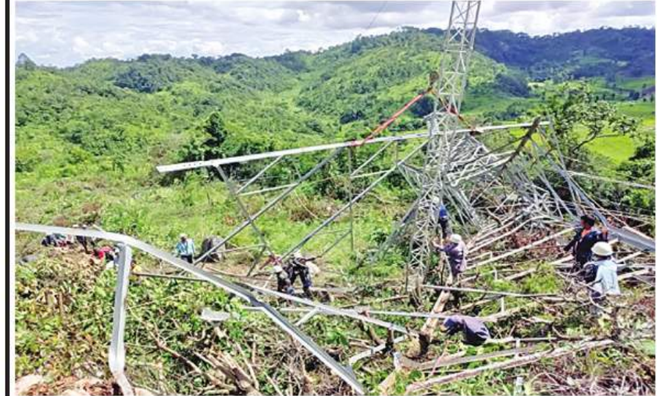
ကေဗွီ ၂၃၀ ဘီလူးချောင်း(၂) - ရွှေမြို့ ဓာတ်အားလိုင်း တာဝါတိုင် ပြုလုပ်ပျက်စီးခဲ့သည့် မှတ်တမ်းဓာတ်ပုံ