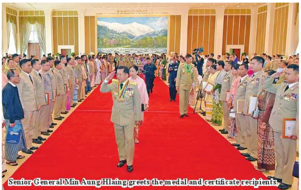
Senior General Min Aung Hlaing greets the medal and certificate recipients.

gle. It is the Tatmadaw that had restored the independence and is protecting it.