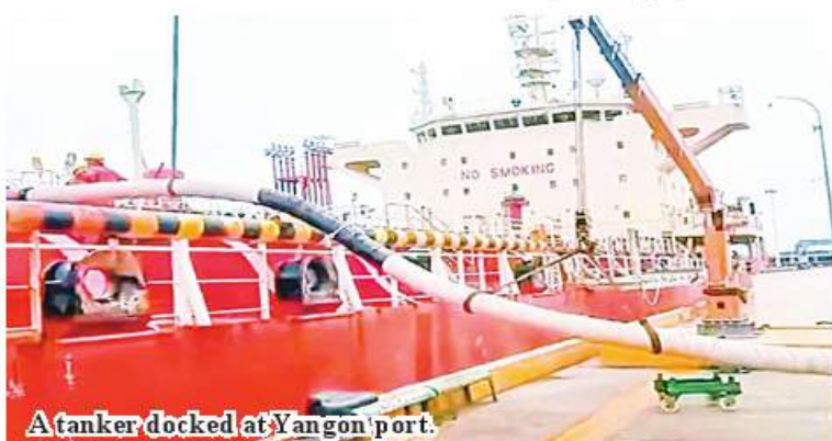
A tanker docked at Yangon port.