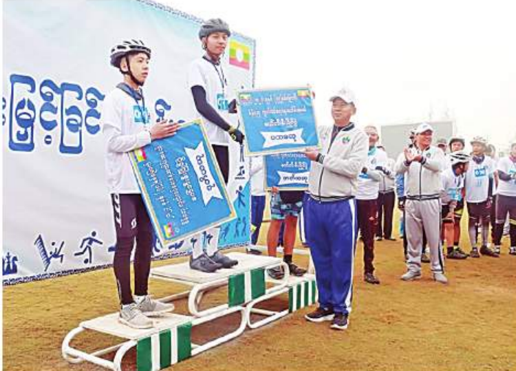
အရှေ့မြောက်တိုင်းစစ်ဌာနချုပ် တိုင်းမှူး ဗိုလ်ချုပ်နိုင်နိုင်ဦး စက်ဘီးစီးပြိုင်ပွဲတွင် ဆုရရှိသူများကို ဆုများပေးအပ်ချီးမြှင့်စဉ်။

နေပြည်တော် ဇန်နဝါရီ ၃ (၇၅)နှစ်မြောက် စိန်ရတုလွတ်လပ်ရေးနေ့ကို ကြိုဆိုဂုဏ်ပြုသောအားဖြင့် စက်ဘီးစီးပြိုင်ပွဲနှင့် မိနိမာရသွန်ပြိုင်ပွဲ