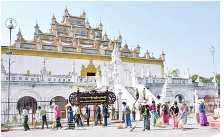
မန္တလေးတိုင်းဒေသကြီး အောင်မြေသာစံမြို့နယ် မဟာအတုလဝေယန်(အတုဓရီ) ကျောင်းတော်ကြီး၌ ဌာနဆိုင်ရာတာဝန်ရှိသူများက စုပေါင်းသန့်ရှင်းရေးဆောင်ရွက်စဉ်။

မြို့နယ် လေးမြို့နယ်တို့၌လည်းကောင်း ချဲ့နွယ်ပေါင်းမြက်များ ခုတ်ထွင်ရှင်းလင်းခြင်း၊ အမှိုက်များရှင်းလင်းခြင်း၊ ရေနုတ်မြောင်းများ တူးဖော်ပေးခြင်း၊ ဘုရား၊ စေတီများနှင့် ရုပ်ပွားတော်များအား ရောင်တော်ဖွင့်ပေးခြင်း၊ ထုံးသက်န်းများ ကပ်လှူခြင်း စသည့် သန့်ရှင်းရေးလုပ်ငန်းများကို ကုသိုလ်ပြုဆောင်ရွက်ကြသည်။ ယင်းသို့ ဆောင်ရွက်နေမှုများကို သက်ဆိုင်ရာ တိုင်းစစ်ဌာနချုပ်များမှ တိုင်းမှူးများနှင့် တာဝန်ရှိသူများက သွားရောက်ကြည့်ရှုအားပေးပြီး လိုအပ်သည်များ ပေါင်းစပ်ညှိနှိုင်းဆောင်ရွက်ပေးခဲ့ကြောင်း သတင်းရရှိသည်။