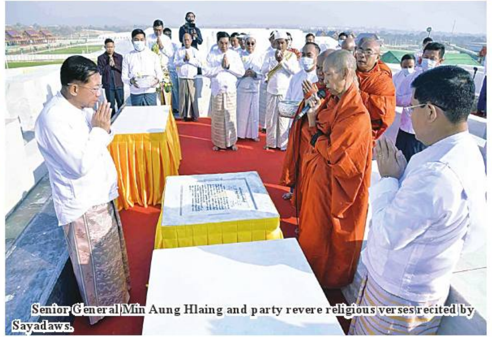
Senior General Min Aung Hlaing and party revere religious verses recited by Sayadaws.

Nay Pyi Taw January 27 in Maravijaya Buddha Park in Dekkhinathiri Township, Nay Pyi Taw, Union Territory. A ceremony to enshrine religious objects in the reliquaries was held this morning at the centre point on the Yadana Throne of Maravijaya Buddha Image