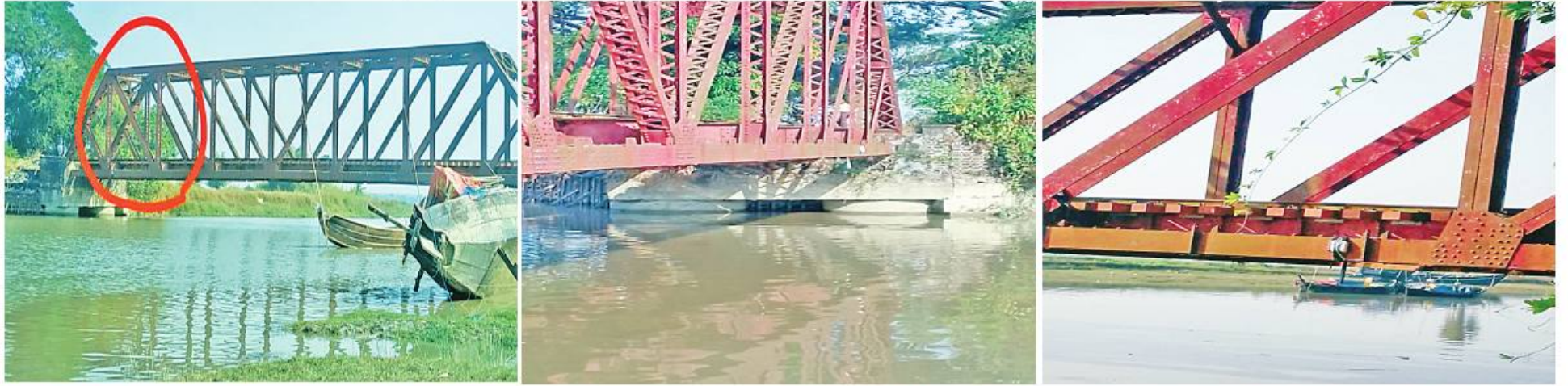
အကြမ်းဖက်သမားများ မိုင်းထောင်ဖောက်ခွဲမှုကြောင့် ကျိုက်ထိုမြို့နယ် ကျိုက္ကသာဘူတာနှင့် မုပွလင်ဘူတာကြား မိုင်တိုင်အမှတ် ၈၈/၂၂-၂၄ ကြား တံတားအမှတ်(၄၁) ပျက်စီးခဲ့မှု မှတ်တမ်းဓာတ်ပုံ။

နေပြည်တော် ဇန်နဝါရီ ၂၇ - မော်လမြိုင် လမ်းပိုင်းရှိ မွန်ပြည်နယ် မုပွလင်ဘူတာနှင့် ကျိုက္ကသာဘူတာအကြား မိုင်တိုင်အမှတ် ၈၈/၂၂-၂၄ ရှိ တံတားအမှတ်(၄၁)ကို ဇန်နဝါရီ ၂၆ ရက် နံနက် ၄ နာရီခန့်တွင် အကြမ်းဖက် သမားများက မိုင်းထောင်ဖောက်ခွဲခဲ့ရာ တံတားပျက်စီးခဲ့ပြီး မပေါက်ကွဲသေးသည့် လက်လုပ်မိုင်း ၁၀ လုံးကိုလည်း တွေ့ရှိရ