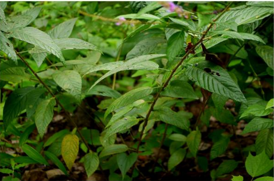
ဆေးဖက်ဝင် လောက်သေပင်ကို တွေ့ရစဉ်။

ဖြေ ။ ။ ကလေး ကိုယ်ပူ၊ ချောင်းဆိုး၊ အဖျားပြတ်ပြီးနောက် ချောင်းဆိုးကျန်ဖြစ်နေသူတွေအတွက် ဆေးနည်းမှာ အိမ်သုံးဆားကို နီရဲအောင်လှော်ပြီး သံပရာရည်နဲ့ ဖျော်လျက်ပေးပါ။ ပရဆေးဆိုင်မှာ သိန္နောဆား၊ ဇဝက်သာ၊ ပတ်ကောကြီးတစ်ကျပ် သားစိကိုဝယ်ပြီး နွယ်ချို သုံးကျပ်သားနဲ့ ရောကြိတ်ကာ အမှုန့်လုပ်လျက်ပေးပါ။ ချင်းပီးပါး ခုနစ်လွှာ၊ ကွမ်းရွက် သုံးရွက်၊ ထန်းလျက် ငါးခဲကို ရေခဲသေတ္တာထဲထည့်ပြီး ချက်ဖိုက်ပြီး ဆားလှော်