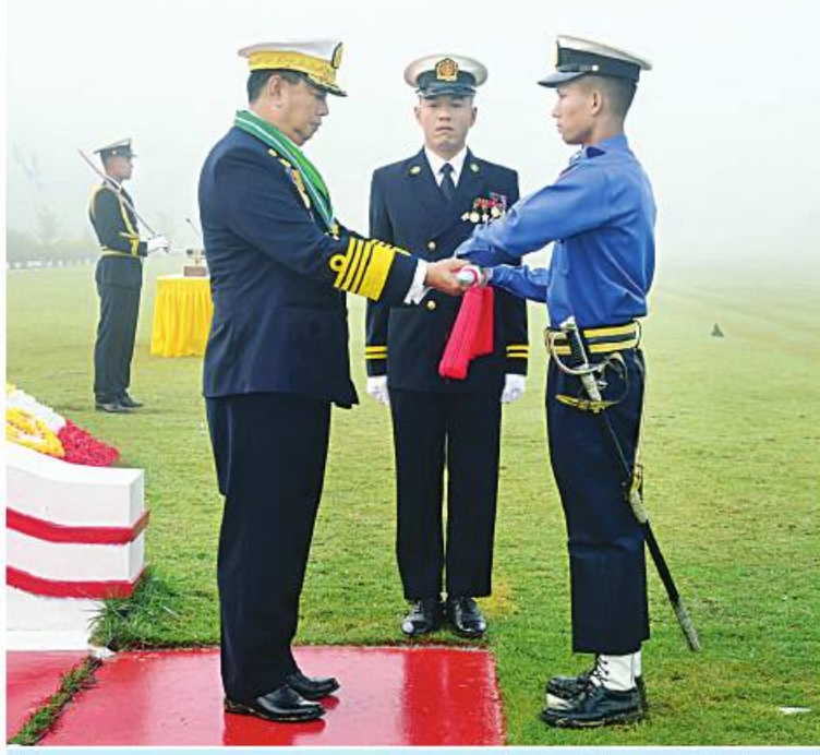
ကာကွယ်ရေးဦးစီးချုပ်(ရေ) ဗိုလ်ချုပ်ကြီး ဝေယျကျော်ထင် စည်သူမိုးအောင်က တပ်မတော်(ရေ) အရာရှိငယ်(စီမံခန့်ခွဲရေး) သင်တန်းအမှတ်စဉ်(၈၂)မှ အကောင်းဆုံး ကျောင်းသားဆုရ ရေ ၅၆၅၄ ဗိုလ်စိုင်းခန့်သူရိန်အား ထူးချွန်ဆုပေးအပ်ချီးမြှင့်စဉ်။

ယနေ့ခေတ် အမျိုးသမီးအရာရှိ၊ စစ်သည်များအနေဖြင့် ခက်ထန်ကြမ်းတမ်း သည့် ပင်လယ်သမုဒ္ဒရာကို မိုင်ထောင်ချီ ဖြတ်ကျော်ကာ ပြည်ပနိုင်ငံချစ်ကြည်ရေး ခရီးစဉ်များနှင့် ပူးတွဲလေ့ကျင့်ခန်းများတွင် အမျိုးသားအရာရှိ၊ စစ်သည်များနည်းတူ ရင်ပေါင်တန်း ပါဝင်ဆောင်ရွက်နိုင်ခဲ့ကြ ကြောင်း၊ မျိုးဆက်သစ်အမျိုးသမီးအရာရှိ ငယ်များအနေဖြင့် ပညာရပ်ပိုင်းဆိုင်ရာ ကျွမ်းကျင်ပြီး အများက အားကျအတုယူ ရသည့် စစ်သမီးများဖြစ်စေရန် အလေး အနက်ထားကြိုးစား တာဝန်ထမ်းဆောင် သွားရန်လို့ကြောင်း။ စာမျက်နှာ ၂၂ သို့။