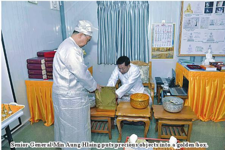
Senior General Min Aung Hlaing puts precious objects into a golden box.

The congregation recited Buddha sasanamci-ratithatu three times to conclude the ceremony. Senior General Min Aung Hlaing performs religious rites to mark the success of the ceremony. 100