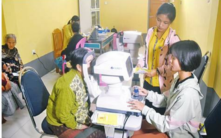
ကေတုမတီမြို့သစ်ရှိ သီတဂူကေတုမတီဗုဒ္ဓတက္ကသိုလ် အာယုဒါနဆေးရုံတော်၌ ဒေသခံပြည်သူများကို မျက်စိစစ်သပ်ကုသမှုများ ဆောင်ရွက်ပေးစဉ်။

ဗိုလ်ချုပ်ထိန်ဝင်းနှင့် တာဝန်ရှိသူများက ယနေ့ နံနက်ပိုင်းတွင် သွားရောက်ကြည့်ရှုအားပေးပြီး လိုအပ်သည်များ ညှိနှိုင်းဆောင်ရွက်ပေးသည်။ အဆိုပါ သီတဂူကေတုမတီ ဗုဒ္ဓတက္ကသိုလ် အာယုဒါနဆေးရုံတော်သည် သီတဂူဗုဒ္ဓတက္ကသိုလ်များနှင့် ဆေးရုံတော်များ၏ အဓိပတိ အဘိဓမ္မာရှာရရှိရာ အဘိဓမ္မာအဂ္ဂမဟာသဒ္ဓမ္မဇောတိက မဟာဓမ္မကထိက ဗဟုဇနဟိတဓရ ရွှေကျင်နိကာယ ဥက္ကဋ္ဌ ရွှေကျင်သာသနာပိုင် သီတဂူဆရာတော်ဘုရားကြီး ဒေါက်တာ ဘဒ္ဒန္တဉာဏ်ဿရ တည်ထောင်တော်မူသည့် ဆေးရုံတော် ၄၇ ခုအနက် အခု ၄၀ မြောက် အာယုဒါနဆေးရုံတော်ဖြစ်ပြီး မျက်စိဝေဒနာရှင် တစ်နေ့လျှင် ဦးရေ ၁၅၀ ခန့်အား မျက်စိစစ်သပ်ဆေးပေးခြင်း၊ လေဆာပစ်ခြင်း၊ ခွဲစိတ်ကုသခြင်း၊ မျက်စိတိမ်များ ခြစ်ထုတ်ခြင်း၊ မျက်လုံးအစားထိုးကုသခြင်းများကို ဇန်နဝါရီ ၂၆ ရက်မှ ၂၈ ရက်ထိ ကုသပေးသွားမည်ဖြစ်ကြောင်း သတင်းရရှိသည်။