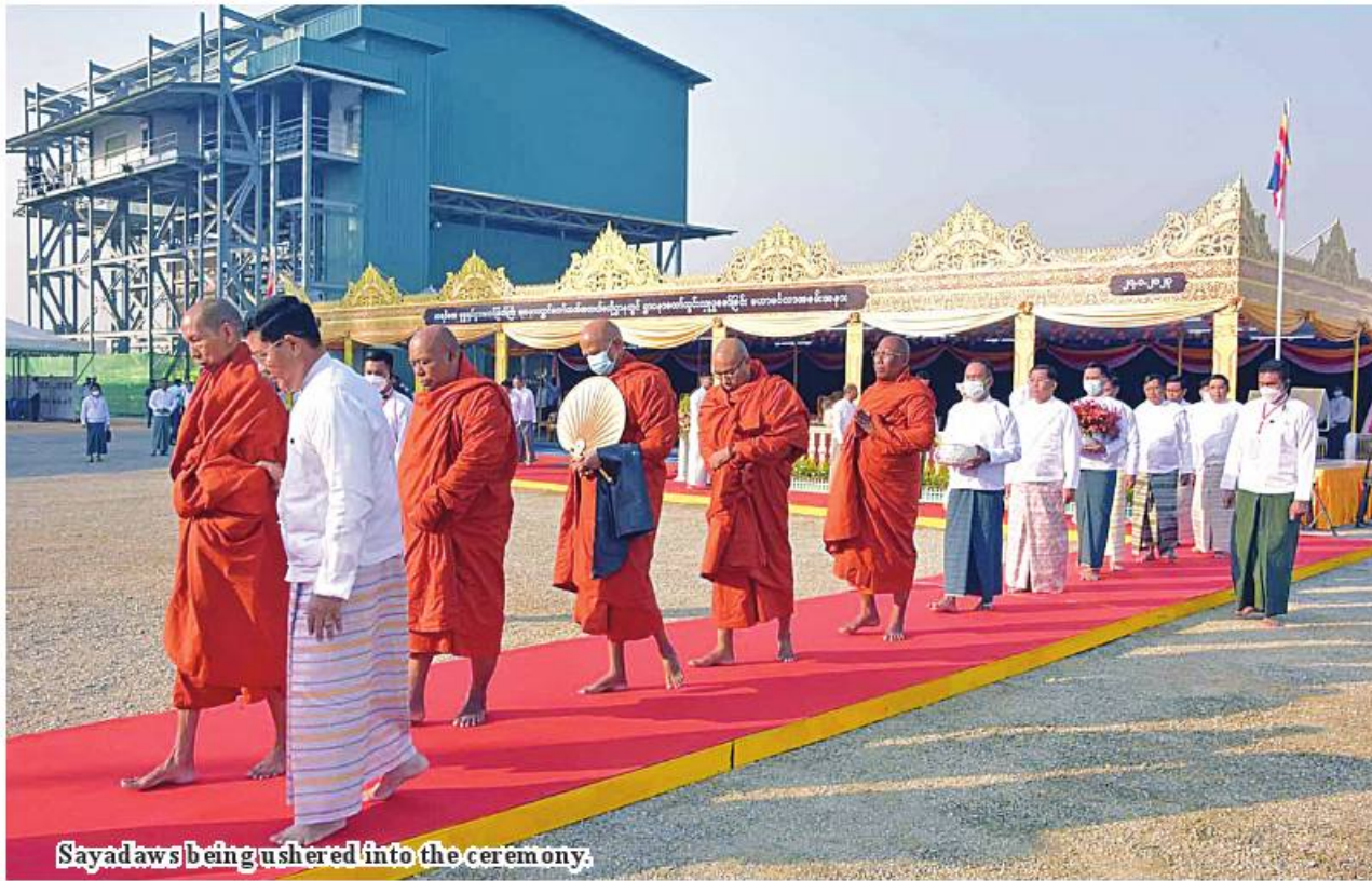
Sayadaws being ushered into the ceremony.