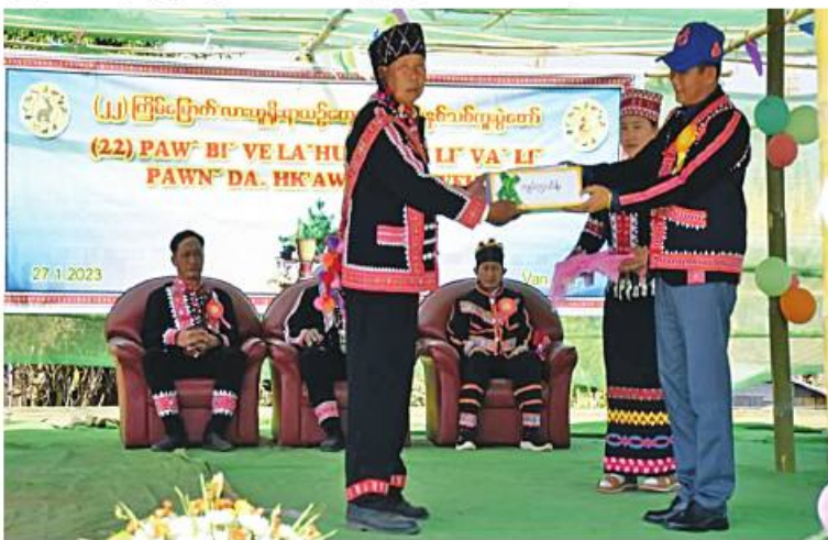
အရှေ့အလယ်ပိုင်းတိုင်းစစ်ဌာနချုပ် တိုင်းမှူး ဗိုလ်ချုပ်မျိုးမင်းထွန်း လားဟူရိုးရာယဉ်ကျေးမှု နှစ်သစ်ကူးပွဲတော်အတွက် ဂုဏ်ပြုချီးမြှင့်ငွေနှင့် လားဟူတိုင်းရင်းသားရိုးရာအကအဖွဲ့များအတွက် ဂုဏ်ပြုချီးမြှင့်ငွေများ ပေးအပ်စဉ်။

ရှမ်းပြည်နယ်(တောင်ပိုင်း) ကျေးသီးမြို့နယ် ဝမ်စိမ်းကျေးရွာ၌ (၂၂) ကြိမ်မြောက် လားဟူရိုးရာယဉ်ကျေးမှု နှစ်သစ်ကူးပွဲတော်ကို ယနေ့ နံနက်ပိုင်းတွင်ပြုလုပ်ရာ အရှေ့အလယ်ပိုင်းတိုင်းစစ်ဌာနချုပ် တိုင်းမှူး ဗိုလ်ချုပ်မျိုးမင်းထွန်းနှင့် ဌာနဆိုင်ရာ တာဝန်ရှိသူများ၊ လားဟူအမျိုးသားစာပေနှင့် ယဉ်ကျေးမှုအဖွဲ့ဥက္ကဋ္ဌနှင့် အဖွဲ့ဝင်များ၊ လားဟူတိုင်းရင်းသားများ၊ ဒေသခံတိုင်းရင်းသားပြည်သူများ တက်ရောက်ကြသည်။