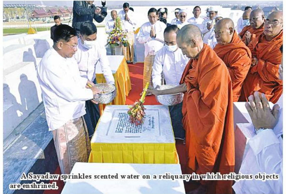
A Sayadaw sprinkles scented water on a reliquary in which religious objects are enshrined.