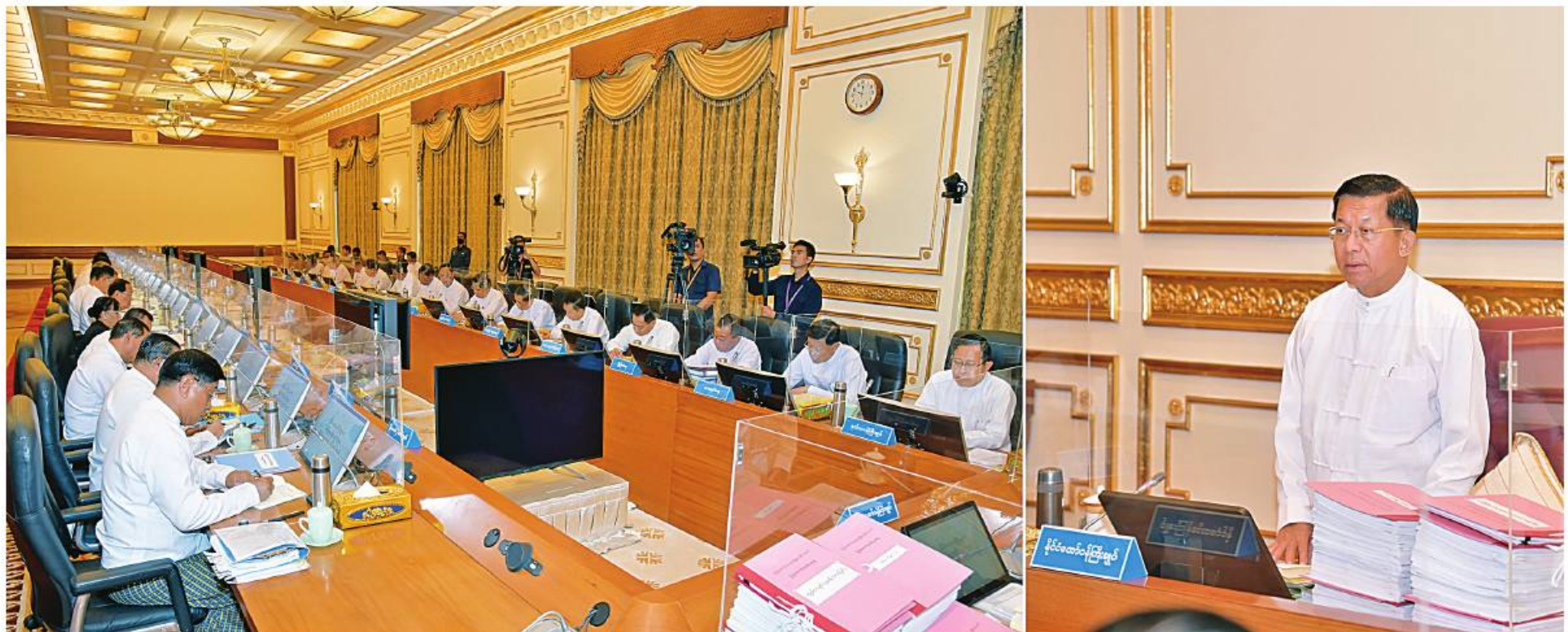
နိုင်ငံတော်စီမံအုပ်ချုပ်ရေးကောင်စီဥက္ကဋ္ဌ နိုင်ငံတော်ဝန်ကြီးချုပ် ဗိုလ်ချုပ်မှူးကြီးမင်းအောင်လှိုင် ပြည်ထောင်စုအစိုးရအဖွဲ့အစည်းအဝေး အမှတ်စဉ်(၁/၂၀၂၃)တွင် အမှာစကားပြောကြားစဉ်။

နေပြည်တော် ဇန်နဝါရီ ၂၃ တက်ရောက်အမှာစကားပြောကြားသည်။ ပြည်ထောင်စုအစိုးရအဖွဲ့ အစည်းအဝေး အစည်းအဝေးသို့ နိုင်ငံတော်စီမံအုပ်ချုပ်ရေး ကောင်စီဥက္ကဋ္ဌ ဗိုလ်ချုပ်မှူးကြီးမင်းအောင်လှိုင် နိုင်ငံတော်စီမံအုပ်ချုပ်ရေး နိုင်ငံတော်ဝန်ကြီးချုပ် ဗိုလ်ချုပ်မှူးကြီးမင်းအောင်လှိုင် ဦးစွာ နိုင်ငံတော်စီမံအုပ်ချုပ်ရေးကောင်စီ ဥက္ကဋ္ဌ စာမျက်နှာ ၁၉ ကော်လံ ၁ ☆