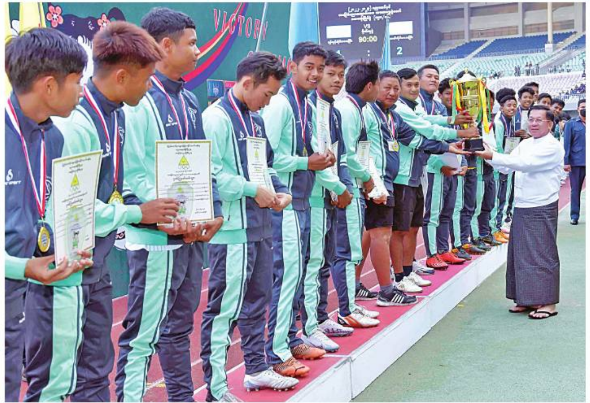
နိုင်ငံတော်စီမံအုပ်ချုပ်ရေးကောင်စီဥက္ကဋ္ဌ နိုင်ငံတော်ဝန်ကြီးချုပ် ဗိုလ်ချုပ်မှူးကြီးမင်းအောင်လှိုင် ပထမဆုရရှိသည့် ရော့တတီတိုင်းဒေသကြီးအသင်းအား တံခွန်စိုက်ဖလားပေးအပ်ချီးမြှင့်စဉ်။

ဦးစွာ နိုင်ငံတော်စီမံအုပ်ချုပ်ရေးကောင်စီဥက္ကဋ္ဌ နိုင်ငံတော်ဝန်ကြီးချုပ်နှင့် တက်ရောက်လာကြသူများသည် ၂၀၂၂-၂၀၂၃ ပညာသင်နှစ် အခြေခံပညာ