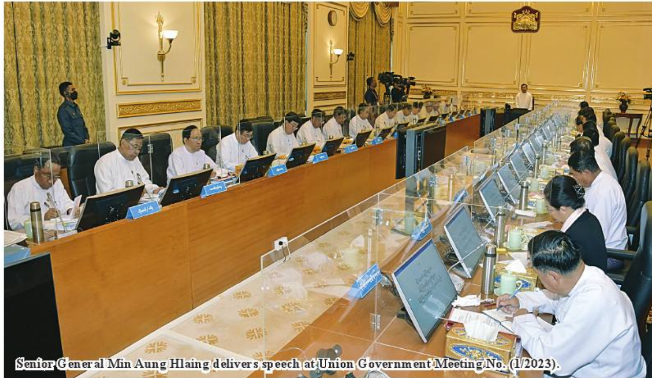
Senior General Min Aung Hlaing delivers speech at Union Government Meeting No. (1/2023).