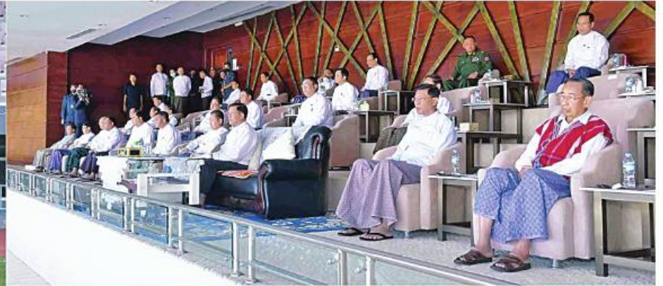
Senior General Min Aung Hlaing watches the final match of the men's football tournament of the Basic Education Students Sports Festival for 2022-23 academic year.

Nay Pyi Taw January 27 Chairman of the State Administration Council Prime Minister Senior General Min Aung Hlaing attended to watch the final match of the men's football tournament of the Basic Education Students Sports Festival for 2022-23 academic year and awarded prizes to the winning teams at the prize awarding ceremony at Wunna Theikdi Stadium in Nay Pyi Taw this afternoon.