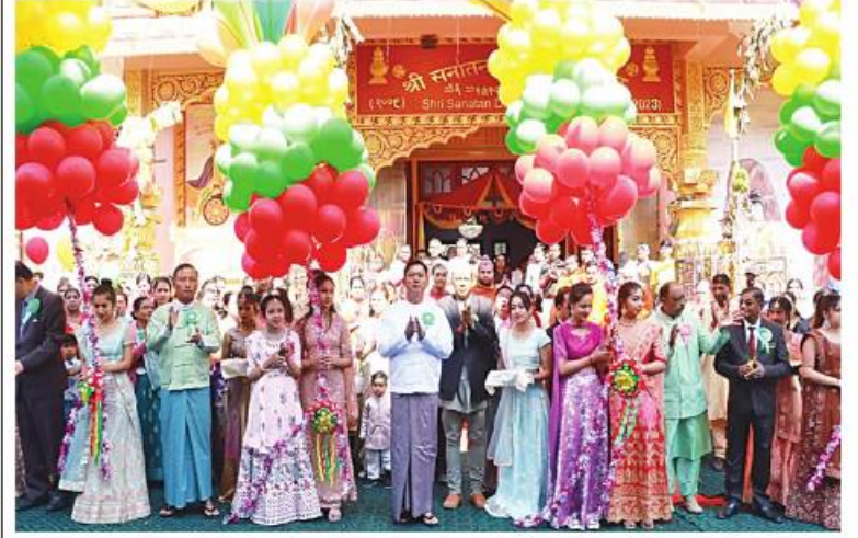
အရှေ့မြောက်တိုင်းစစ်ဌာနချုပ် တိုင်းမှူး ဗိုလ်ချုပ်ခိုင်ခိုင်ဦးနှင့် တာဝန်ရှိသူများက သီရိသနန္ဒဓမ္မ ဟိန္ဒူဘုရားကျောင်းကို ဖဲကြီးဖြတ်ဖွင့်လှစ်ပေးစဉ်။