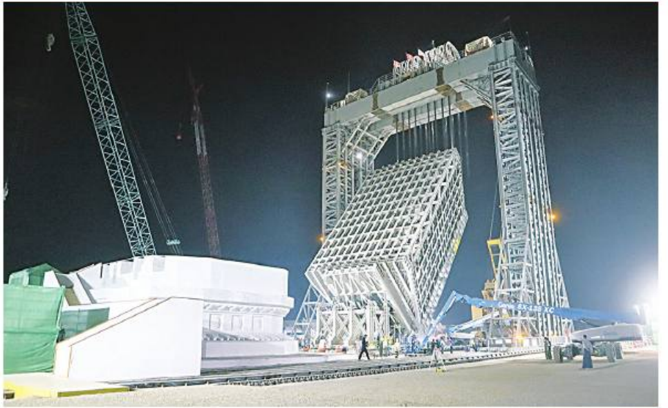
မာရိုဇယဗုဒ္ဓရုပ်ပွားတော်မြတ်ကြီးအား ဇန်နဝါရီ ၂၇ ရက် မွန်းတည့် ၁၂ နာရီအချိန်အထိ ရတနာ ပလ္လင်တော်ထက်သို့ ၅၁ ဒဿမ ၂ ဒီဂရီ ပင့်ထောင်ပူဇော်ပြီးစီးမှုကို တွေ့ရစဉ်။