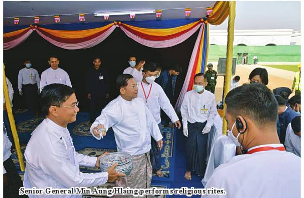
Senior General Min Aung Hlaing performs religious rites.