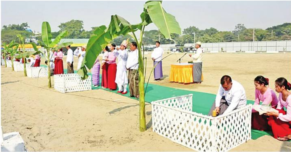
မန္တလေးတိုင်းဒေသကြီးဝန်ကြီးချုပ် ဦးမောင်ကို၊ အလယ်ပိုင်းတိုင်းစစ်ဌာနချုပ် တိုင်းမှူး ဗိုလ်ချုပ်ကြီးတို့က မန္တလေးဘဏ်ခွဲ ရုံးအဆောက်အအုံအသစ်ပန္နက်တော်တင်မင်္ဂလာအခမ်းအနား၌ မင်္ဂလာပန္နက်တိုင်အား ပန္နက်တော်တင်ခြင်းပြုလုပ်စဉ်။

နေပြည်တော် ဇန်နဝါရီ ၂၇ မြန်မာနိုင်ငံတော်ဗဟိုဘဏ် မန္တလေးဘဏ်ခွဲ ရုံးအဆောက်အအုံအသစ် ပန္နက်တော်တင်မင်္ဂလာကို ယနေ့နံနက်ပိုင်းတွင် မန္တလေးတိုင်းဒေသကြီး ချမ်းမြသာစည်မြို့နယ် ချမ်းမြသာစည်တောင်ရပ်ကွက် ဆင်ဖြူကန်ကွင်း၌ပြုလုပ်ရာ တိုင်းဒေသကြီးဝန်ကြီးချုပ် ဦးမောင်ကို၊ မြန်မာနိုင်ငံတော်ဗဟိုဘဏ်ဥက္ကဋ္ဌ ဒေါ်သန်းသန်းဆွေ၊ အလယ်ပိုင်းတိုင်းစစ်ဌာနချုပ် တိုင်းမှူး ဗိုလ်ချုပ်ကြီးတို့၊ ဌာနဆိုင်ရာတာဝန်ရှိသူများနှင့် ဖိတ်ကြားထားသူများ တက်ရောက်