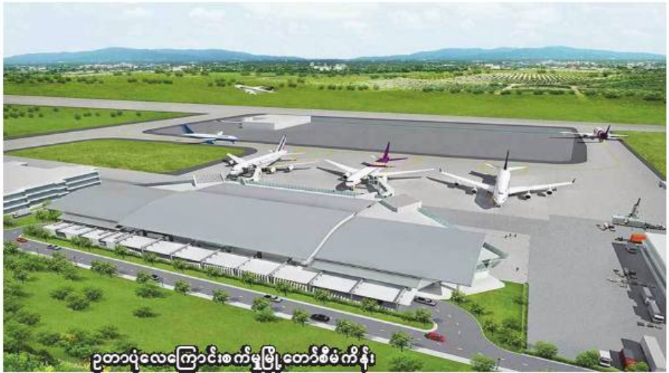
ဥတာပုံလေကြောင်းစက်မှုမြို့တော်စီမံကိန်း

ဗန်ကောက် ၀၃၀၁၀၂၂၇ ဥတာပုံလေကြောင်းစက်မှု မြို့တော်သစ်ကို ဘတ်ငွေ ၅၂၀၀ (အမေရိကန်ဒေါ်လာ ၈၃၃၃၃၀) ဘီလီယံ အကုန်အကျခံ တည်ဆောက်မည်ဖြစ်ပြီး တည် ဆောက်ရေး လုပ်ငန်းများအား ယခုနှစ်စတင်တွင် စတင်မည်ဖြစ်