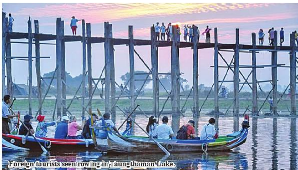
Foreign tourists seen rowing in Taungthaman Lake.

Mandalay January 27 Number of travellers from Thailand, Vietnam and Russia at Taungthaman bridge and lake is on the increase, said secretary U Soe Win of Bridge Maintenance Body.