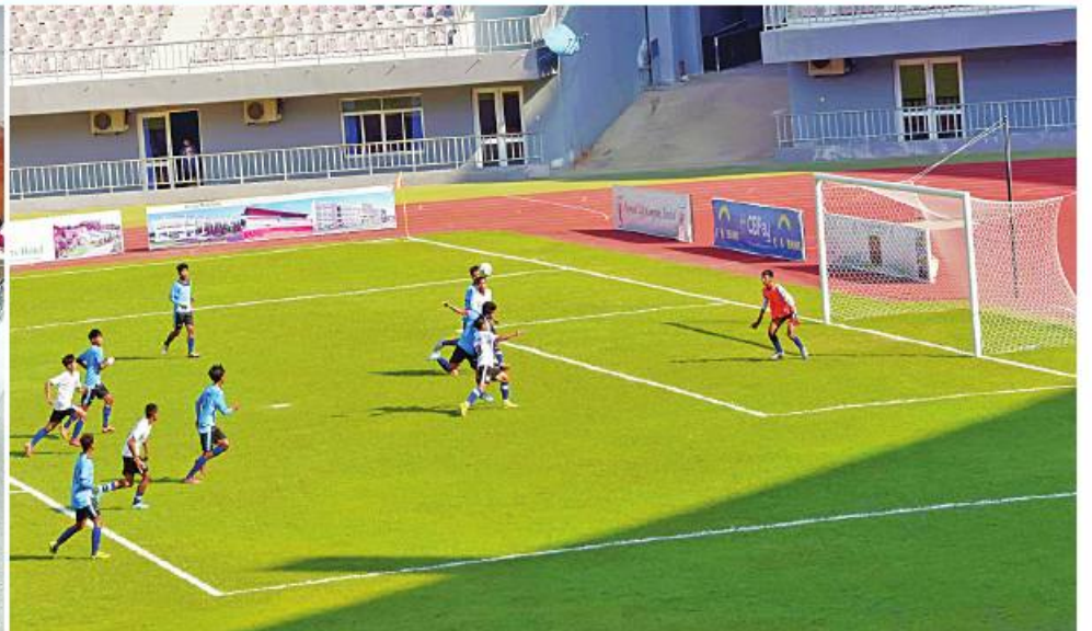
နိုင်ငံတော်စီမံအုပ်ချုပ်ရေးကောင်စီဥက္ကဋ္ဌ နိုင်ငံတော်ဝန်ကြီးချုပ် ဗိုလ်ချုပ်မှူးကြီးမင်းအောင်လှိုင်နှင့် တက်ရောက်လာကြသူများက ၂၀၂၂-၂၀၂၃ ပညာသင်နှစ် အခြေခံပညာကျောင်းသားအားကစားပွဲတော် ဘောလုံးပြိုင်ပွဲ အမျိုးသားဗိုလ်လုပွဲအဖြစ် ရန်ကုန်တိုင်းဒေသကြီးအသင်းနှင့် ရော့တတီတိုင်းဒေသကြီးအသင်းတို့၏ ယှဉ်ပြိုင်နေမှုကိုကြည့်ရှုအားပေးစဉ်။

နေပြည်တော် ဇန်နဝါရီ ၂၇ ၂၀၂၂-၂၀၂၃ ပညာသင်နှစ် အခြေခံပညာကျောင်းသား အားကစားပွဲတော် ဘောလုံးပြိုင်ပွဲ အမျိုးသားဗိုလ်လုပွဲနှင့် ဆုချီးမြှင့်ခြင်းအခမ်းအနားကို ယနေ့ ညနေပိုင်းတွင် နေပြည်တော်ရှိ ဝဏ္ဏသိဒ္ဓိဘောလုံးကွင်း၌ကျင်းပရာ နိုင်ငံတော်စီမံအုပ်ချုပ်ရေးကောင်စီဥက္ကဋ္ဌ နိုင်ငံတော်ဝန်ကြီးချုပ် ဗိုလ်ချုပ်မှူးကြီးမင်းအောင်လှိုင် တက်ရောက်ကြည့်ရှုအားပေးပြီး ဆုများပေးအပ်ချီးမြှင့်သည်။