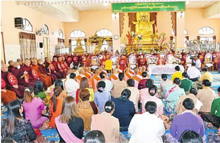
ကချင်ပြည်နယ်အစိုးရအဖွဲ့က ကြီးမှူးကျင်းပသည့် ဒုတိယအကြိမ် စာအောင်ဆုနှင့်သဘင်မင်္ဂလာအခမ်းအနား ကျင်းပစဉ်။

ကချင်ပြည်နယ်အစိုးရအဖွဲ့က ကြီးမှူးကျင်းပသည့် ဒုတိယအကြိမ် စာအောင်ဆုနှင့်သဘင်မင်္ဂလာကို ယနေ့တွင် ကချင်ပြည်နယ် မြစ်ကြီးနားမြို့ရှိ အုတ်တော်ရှင်တောင်တန်းသာသနာပြု ဝတ်ကျောင်းတိုက်၌ ပြုလုပ်ရာ ကချင်ပြည်နယ် သံယနာယက အဖွဲ့အကျိုးတော်ဆောင် ဓမ္မရက္ခိတ ဝန်းသိုကျောင်းတိုက်ဆရာတော် အဂ္ဂမဟာပဏ္ဍိတ ဘဒ္ဒန္တကေတုမာလာ အမျှော်ပြုသော ပင့်သံယာများ၊ စာအောင်သံယာတော်များနှင့် စာအောင်သီလရှင်ဆရာလေးများ ကြွရောက်တော်မူကြပြီး ကချင်ပြည်နယ် ဝန်ကြီးချုပ် ဦးခက်ထိန်နန်း၊ မြောက်ပိုင်း တိုင်းစစ်ဌာနချုပ် တိုင်းမှူး ဗိုလ်ချုပ် ကိုကိုမောင်နှင့် အဖွဲ့ဝင်များ၊ ပြည်နယ်