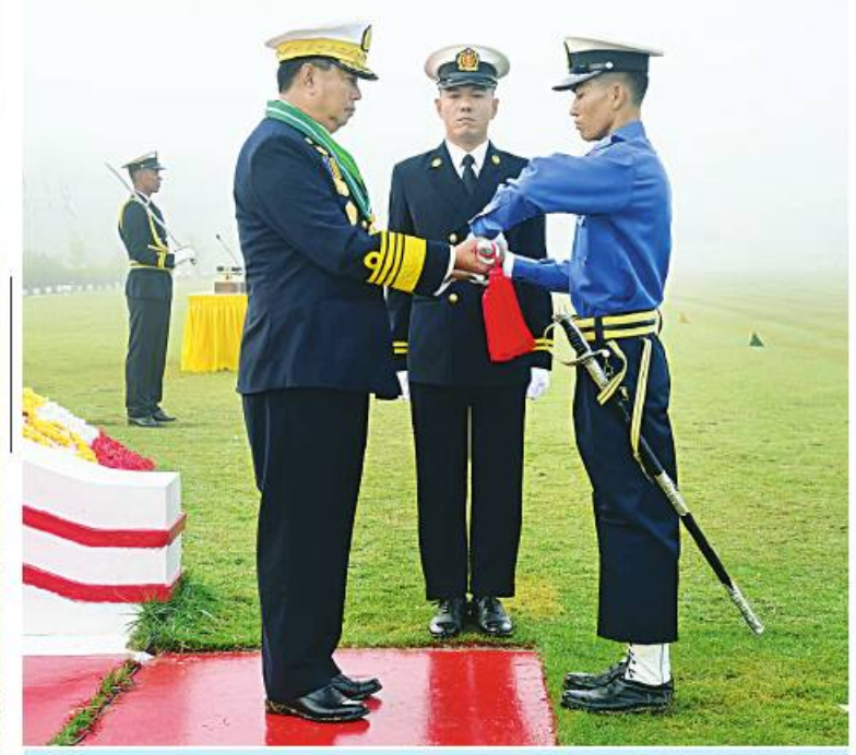
ကာကွယ်ရေးဦးစီးချုပ်(ရေ) ဗိုလ်ချုပ်ကြီး ဝေယျကျော်ထင် စည်သူမိုးအောင်က တပ်မတော်(ရေ) အရာရှိငယ်(အင်ဂျင်နီယာ) သင်တန်းအမှတ်စဉ်(၅၆)မှ အကောင်းဆုံး ကျောင်းသားဆုရ ရေ ၅၆၆၂ ဗိုလ်နိုင်ဦးအား ထူးချွန်ဆုပေးအပ်ချီးမြှင့်စဉ်။

အမှတ်စဉ်(၅၆)နှင့် တပ်မတော်(ရေ) အမျိုး သမီး အရာရှိငယ်သင်တန်းအမှတ်စဉ်(၈) သင်တန်းဆင်း ရုတ်ပြုစစ်ရေးပြအခမ်း အနားကို ယနေ့နံနက်ပိုင်းတွင် သန်လျင် တပ်နယ်ရှိ ရေတပ်လေ့ကျင့်ရေးဌာနချုပ် စစ်ရေးပြတွင်း၌ ကျင်းပရာ နိုင်ငံတော်စီမံ အုပ်ချုပ်ရေးကောင်စီဥက္ကဋ္ဌ တပ်မတော် ကာကွယ်ရေးဦးစီးချုပ်ကိုယ်စား ကာကွယ် ရေးဦးစီးချုပ်(ရေ) ဗိုလ်ချုပ်ကြီး ဝေယျ ကျော်ထင် စည်သူမိုးအောင် တက်ရောက် မိန့်ခွန်းပြောကြားသည်။