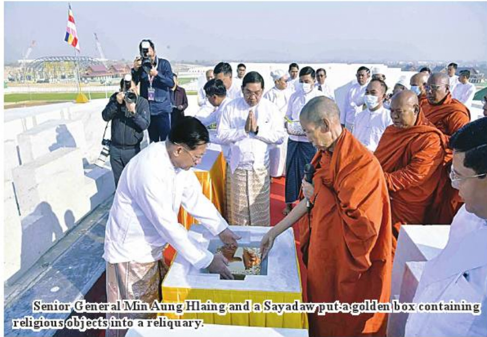
Senior General Min Aung Hlaing and a Sayadaw put a golden box containing religious objects into a reliquary.