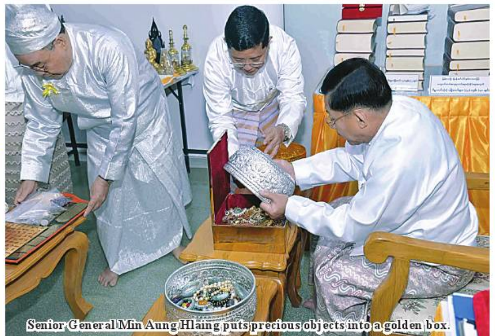
Senior General Min Aung Hlaing puts precious objects into a golden box.