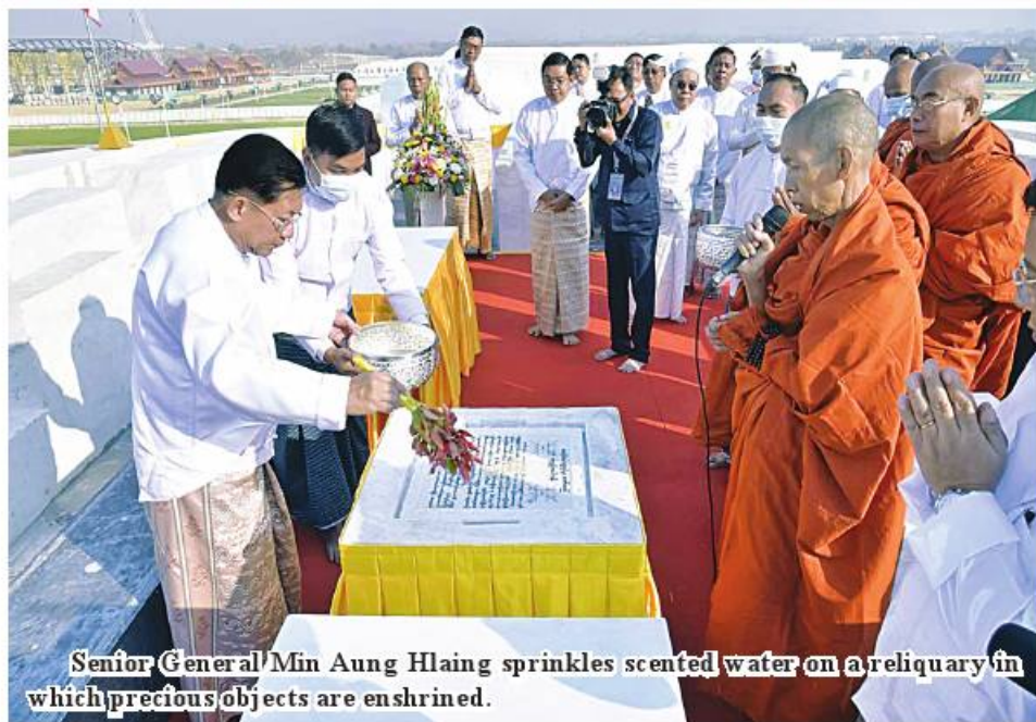
Senior General Min Aung Hlaing sprinkles scented water on a reliquary in which precious objects are enshrined.