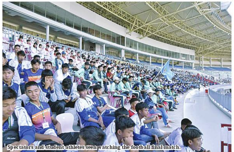
Spectators and student athletes seen watching the football final match.

for training, they will have the chance to take part in the ASEAN University Games with better sports skills when those basic education students attend the universities and more selected national players will come out. 100