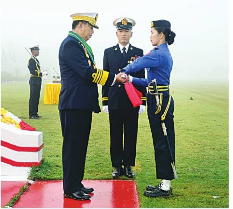
ကာကွယ်ရေးဦးစီးချုပ်(ရေ) ဗိုလ်ချုပ်ကြီး ဝေယျကျော်ထင် စည်သူမိုးအောင်က တပ်မတော်(ရေ) အမျိုးသမီးအရာရှိငယ်သင်တန်းအမှတ်စဉ်(၈)မှ အကောင်းဆုံး ကျောင်းသားဆုရ ရေ ၅၆၇၄ ဗိုလ်ဒေါ်ခိုင်ခန့်ကျော်အား ထူးချွန်ဆုပေးအပ်ချီးမြှင့်စဉ်။

သင်တန်းအမှတ်စဉ်(၈)မှ အကောင်းဆုံး ကျောင်းသားဆုရ ရေ ၅၆၇၄ ဗိုလ်ဒေါ်ခိုင် ခန့်ခန့်ကျော်နှင့် ရေကြောင်းပညာစာပေ ထူးချွန်ဆုရ ရေ ၅၆၇၇ ဗိုလ်ဒေါ်လှနန္ဒာ ထွန်းတို့ကိုလည်းကောင်း ထူးချွန်ဆုများ အသီးသီးပေးအပ်ချီးမြှင့်သည်။ ထို့နောက် နိုင်ငံတော်စီမံအုပ်ချုပ်ရေး ကောင်စီဥက္ကဋ္ဌ တပ်မတော်ကာကွယ်ရေး ဦးစီးချုပ်ကိုယ်စား ကာကွယ်ရေးဦးစီးချုပ် (ရေ) ဗိုလ်ချုပ်ကြီး ဝေယျကျော်ထင် စည်သူ မိုးအောင်က သင်တန်းဆင်းမိန့်ခွန်းပြော ကြားရာတွင် သင်တန်းသားများကို သင်တန်းကာလအတွင်း၌ နိုင်ငံတကာရေ တပ်စံနှုန်းများနှင့်အညီ ရေကြောင်းဆိုင်ရာ ပညာရပ်များ၊ ရေတပ်စက်မှုလက်မှုပညာရပ် များ၊ ရေတပ်လက်နက်နှင့် လက်နက်စနစ် ပညာရပ်များနှင့် ရေတပ်အုပ်ချုပ်ထောက်ပံ့ မှုပညာရပ်များကို စာတွေ့၊ လက်တွေ့ လေ့ကျင့်သင်ကြားပေးခဲ့ပြီးဖြစ်၍ စစ်ရေ ယာဉ်ကြီးများတွင် တွဲဖက်ပုံစင်တာဝန်ကျ