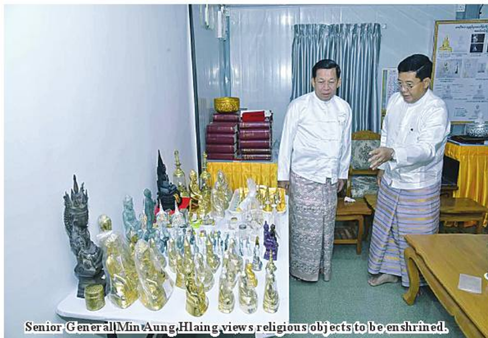
Senior General Min Aung Hlaing views religious objects to be enshrined.