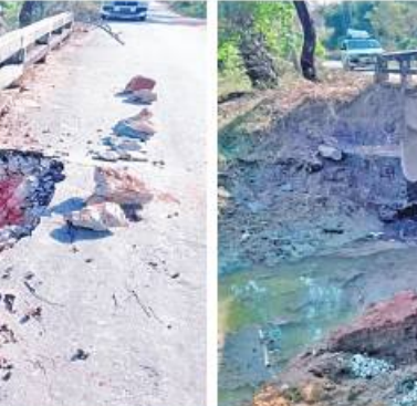
PDF အမည်ခံ အကြမ်းဖက်သမားများ မိုင်းထောင်ဖောက်ခွဲမှုကြောင့် ပျက်စီးခဲ့သည့် လမိုင်း-သောင်ပြင်သွား သံကူကွန်ကရစ် (ကော့လူစစ်)တံတားကို တွေ့ရစဉ်။