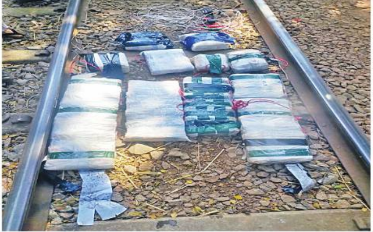
PDF အမည်ခံ အကြမ်းဖက်သမားများ တံတားပေါ်တွင်ထောင်ထားသည့် ဒေသန္တရ လက်လုပ်ရီမိုင်းများကို တွေ့ရစဉ်။

မရှိကြောင်းသိရသည်။ အဆိုပါနေရာ ပတ်ဝန်းကျင်တစ်ဝိုက်ကို လုံခြုံရေးတပ်ဖွဲ့ဝင် များက ဆက်လက်ရှင်းလင်းခဲ့ရာ တံတား ပေါ်တွင်ထောင်ထားသည့် ဒေသန္တရ လက်လုပ်ရီမိုင်း ၁၀ လုံး ထပ်မံတွေ့ရှိ ရသဖြင့် အနီးပတ်ဝန်းကျင်ရှိ ဒေသခံ ပြည်သူများ ထိခိုက်ဒဏ်ရာရရှိမှုမရှိစေရေး လုပ်ငန်းလုပ်ငန်းနှင့်အညီ သက်မဲ့ပြုလုပ် ဆောင်ရွက်ခဲ့ကြောင်း သိရသည်။ အထက်ပါဖြစ်စဉ်မှ ရထားလမ်းကူး တံတားပျက်စီးမှုကို နယ်မြေခံ မြို့ပြအင်ဂျင် နီယာဌာနမှ တာဝန်ရှိသူများက အမြန်ဆုံး ပြန်လည်ကောင်းမွန်စေရေး ဖြုဖြင့်လျက် ရှိကြောင်းနှင့် မိုင်းထောင်ဖောက်ခွဲခဲ့သည့် PDF အမည်ခံ အကြမ်းဖက်သမားများ ကို တရားဥပဒေနှင့်အညီ ထိရောက်စွာ အရေးယူနိုင်ရေး လုံခြုံရေးတပ်ဖွဲ့ဝင်များက ဆက်လက် ဆောင်ရွက်လျက်ရှိကြောင်း သတင်းရရှိသည်။