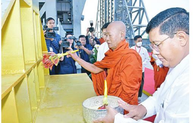
ဆရာတော်ကြီးက ရတနာလွှဲတော်အထောက်အကျိုး သံဃထံစေတင် အား ပရိတ်နံ့သာရည်များ ပက်ဖျန်းပူဇော်၍ သိဒ္ဓိမင်္ဂလာဆင်ယင်စဉ်။