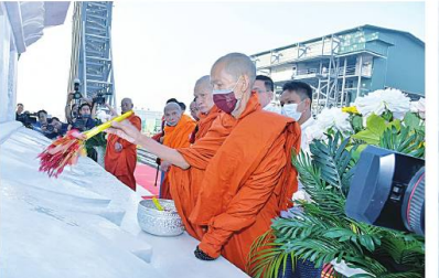
ဆရာတော်ကြီးက ရတနာလွှဲတော်အား ပရိတ်နံ့သာရည်များ ပက်ဖျန်းပူဇော်၍ သိဒ္ဓိမင်္ဂလာဆင်ယင်စဉ်။