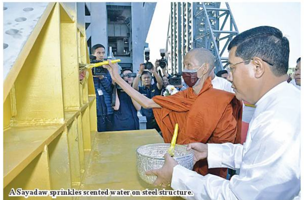
A Sayadaw sprinkles scented water on steel structure.