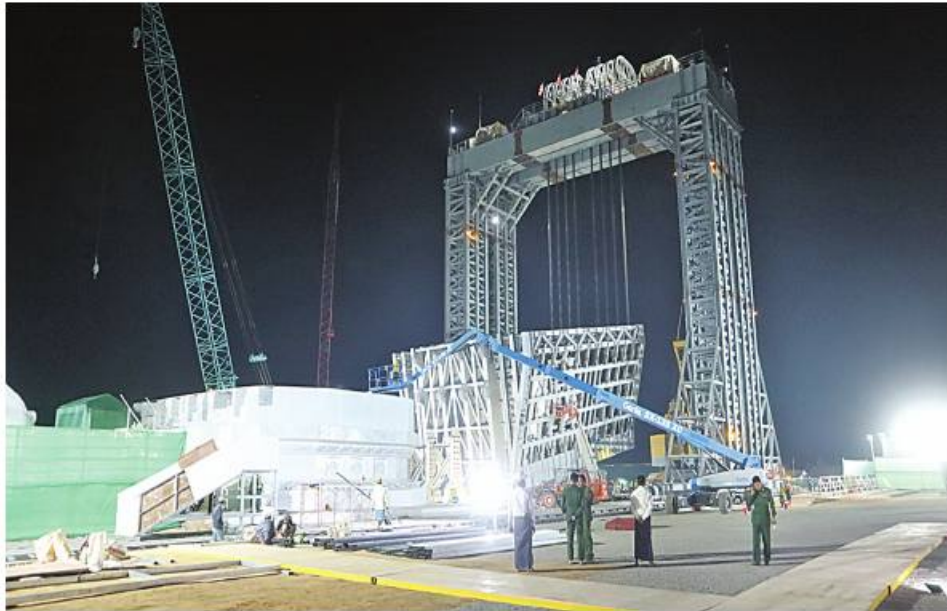
မာရဝိဇယဗုဒ္ဓရုပ်ပွားတော်မြတ်ကြီးအား ဇန်နဝါရီ ၂၆ ရက် ည ၇ နာရီအချိန်အထိ ရတနာပလ္လင်တော်ထက်သို့ ၁၀ ဒီဂရီခန့် ပင့်ဆောင်ပူဇော်ပြီးစီးမှုကို တွေ့ရစဉ်။

သော သာသနိကအဆောက်အအုံများစွာကိုလည်း ထည့်သွင်းတည်ဆောက်လျက်ရှိကြောင်း၊ ထို့ပြင်ဆရာတော်ကြီးများ၏ဩဝါဒမိန့်ကြားချက်များအရ ဆဋ္ဌသင်္ဂါယနာမူပိဋကတ်ကျမ်းစာများကို ကမ္ဘာတပါးသိရှိနိုင်ရေးအတွက် စကျင်ကျောက်ချပ်များပေါ်၌ ခေတ်မီစက်ကိရိယာများအသုံးပြုပြီး ပါဠိအက္ခရာ၊ Romanize Language တို့ဖြင့် ကျောက်စာတော်များ တည်ထားနိုင်ရေးဆောင်ရွက်လျက်ရှိကြောင်း၊ ထုဆစ်ပြီးစီးသည့် ဗုဒ္ဓမြတ်စွာဘုရား၏ နှုတ်ကပါဠိတော်လာ ပိဋကသုံးပုံ အဋ္ဌကထာ ဋီကာ ကျမ်းစာများကို မာရဝိဇယဗုဒ္ဓရုပ်ပွားတော်မြတ်ကြီး၏ မျက်နှာတော်မူရာရှေ့မျက်နှာစာ၌ စိုက်ထူပူဇော်လျက်ရှိပြီး ဘုရားဖူးလာမိဘပြည်သူများအနေဖြင့် ဗုဒ္ဓရုပ်ပွားတော်မြတ်ကြီးအား လာရောက်ဖူးမြော်ချိန်တွင် ကျောက်စာတိုက်အတွင်းရှိ ပိဋကသုံးပုံတော်လာ အဋ္ဌကထာ ဋီကာကျမ်းစာများကို တစ်ပါတည်းလေ့လာနာယူကြည့်ညှိနိုင်ရေး စီစဉ်ဆောင်ရွက်နေခြင်းဖြစ်ကြောင်း၊ထို့ပြင် ကမ္ဘာပေါ်ရှိ ဘုန်းတော်ကြီးကျောင်းများသို့ ပြန့်ဝေရန်အတွက်လည်း ပိဋကတ်ကျမ်းစာအုပ်များကို ပါဠိအက္ခရာနှင့် Romanize Language တို့ဖြင့်ရိုက်နှိပ်ရန် စီမံဆောင်ရွက်လျက်ရှိကြောင်းနှင့် ဗုဒ္ဓရုပ်ပွားတော်မြတ်ကြီး၏ ရတနာပလ္လင်တော်ထက် ဗဟိုမဏ္ဍိုင်ဌာနတွင် ဌာပနာတော်သွင်း လျှူပူဇော်ခြင်းအခမ်းအနားကို ဇန်နဝါရီ ၂၇ ရက် နံနက် ၈ နာရီတွင် ကျင်းပပြုလုပ်မည်ဖြစ်ကြောင်း သတင်းရရှိသည်။