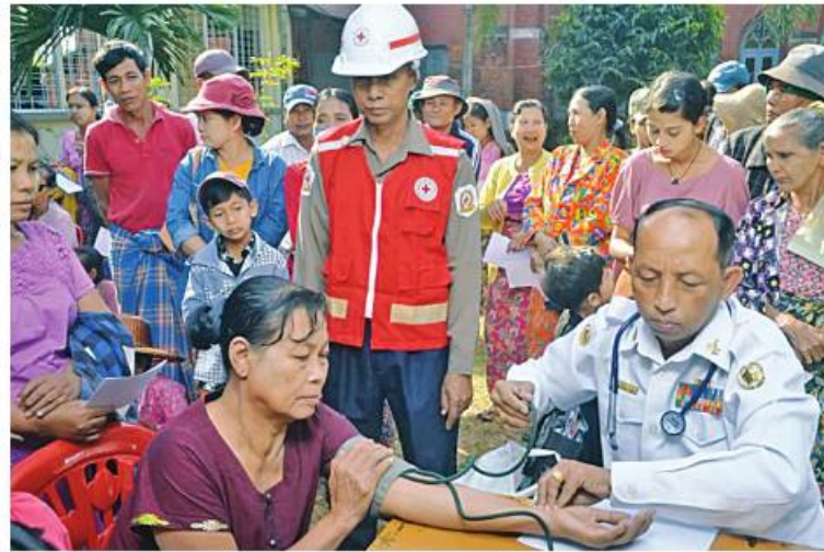
တပ်မတော်မြစ်တွင်းသွား ဆေးရုံရေယာဉ်(ရွှေပုဇွန်)နှင့် မြစ်ရေယာဉ်(စက)တို့က ဒေသခံပြည်သူများကို ကျန်းမာရေးစောင့်ရှောက်မှုလုပ်ငန်းများ ဆောင်ရွက်ပေးစဉ်။ ၅၃ ဦး၊ မျက်စိရောဂါ ၈၆ ဦးနှင့် သွား ရောဂါ ၂၈ ဦးတို့ကို လိုအပ်သည့် ဆေးဝါး ကုသမှုများ ဆောင်ရွက်ပေးသည်။ ထို့ပြင် အထွေထွေခွဲစိတ်လူနာ ၂၇ ဦးနှင့် မျက်စိ ရောဂါရှာဖွေ စစ်ဆေးပေးခြင်းများ ဆောင်ရွက်ပေးခဲ့ကြောင်း သတင်း ရရှိသည်။

နေပြည်တော် ဇန်နဝါရီ ၂၆ ရောဂါတိုင်းဒေသကြီး ရောဂါတီ မြစ်ကြောင်းတစ်လျှောက်ရှိ မြစ်ဝကျွန်းပေါ် ကျေးရွာများမှ ဒေသခံပြည်သူများကို ကျန်းမာရေး စောင့်ရှောက်မှုလုပ်ငန်းများ ဆောင်ရွက်ပေးရန် ရောက်ရှိနေသော တပ်မတော် နယ်လှည့်အထူးကုဆေးအဖွဲ့မှ ပါရဂူများ၊ ဆေးမှူးများနှင့် သူနာပြုများ ပါဝင်သော တပ်မတော်မြစ်တွင်းသွား ဆေးရုံရေယာဉ်(ရွှေပုဇွန်)နှင့် မြစ်ရေ ယာဉ်(စက)တို့သည် ယနေ့တွင် မြောင်းမြ မြို့နယ် တောင်ကလေးကျေးရွာနှင့် ပတ်ဝန်းကျင်ကျေးရွာများမှ ဒေသခံပြည်သူ ၅၃၅ ဦးကို ၎င်းကျေးရွာများရှိ ဗြဟ္မာ ဝိဟာရဘုန်းတော်ကြီးကျောင်း၌ အခြေပြု၍ ကျန်းမာရေး စောင့်ရှောက်မှုလုပ်ငန်းများ ဆက်လက်ဆောင်ရွက်ပေးသည်။ ထိုသို့ ဆောင်ရွက်ပေးရာတွင် ဆေးကု သမှုဆိုင်ရာရောဂါ ၁၅၉ ဦး၊ ခွဲစိတ်ရောဂါ ၃၉ ဦး၊ သားဖွားမီးယပ်ရောဂါ ၃၅ ဦး၊ တလေးရောဂါ ဦးရေ ၄၀၊ အရိုးရောဂါ ၉၅ ဦး၊ နား၊ နှာခေါင်း၊ လည်ချောင်းရောဂါ