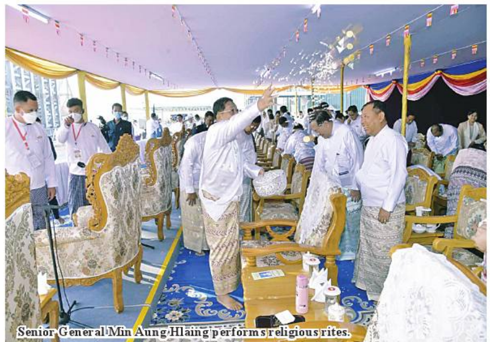
Senior General Min Aung Hlaing performs religious rites.