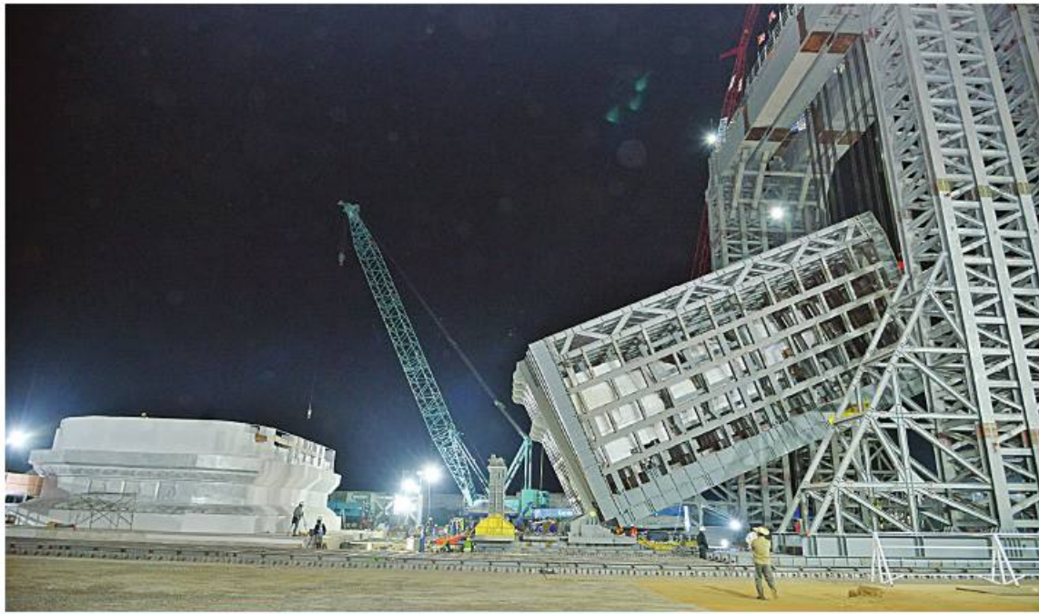
မာရဝိဇယဗုဒ္ဓရုပ်ပွားတော်မြတ်ကြီးအား ဇန်နဝါရီ ၂၆ ရက် ည ၁၂ နာရီအချိန်အထိ ရတနာပလ္လင်တော်ထက်သို့ ၂၆ ဒီဂရီခန့် ပင့်ဆောင်ပူဇော်ပြီးစီးမှုကို တွေ့ရစဉ်။