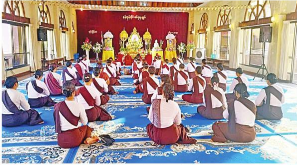
ရန်ကုန်တိုင်းစစ်ဌာနချုပ် တပ်ရင်း၊ တပ်ဖွဲ့များ၌ အတွင်းအောင်မြင်ရုံခမ်း၊ ပါဠိတော်၊ အပြင်အောင်မြင်ရုံခမ်း၊ ပါဠိတော်နှင့် ပရိတ်ကြီး ၁၁ သုတ်မှ ဓမ္မဂုဏ်များ ရွတ်ဖတ်ပူဇော်ကြစဉ်။