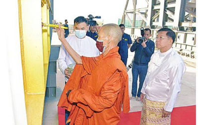
ဆရာတော်ကြီးက ဆင်တုတော်ထည့်သွင်းထားသည့် သံဃထံစေတင် အား ပရိတ်နံ့သာရည်များ ပက်ဖျန်းပူဇော်၍ သိဒ္ဓိမင်္ဂလာဆင်ယင်စဉ်။