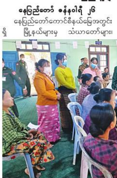
နေပြည်တော်တိုင်းစစ်ဌာနချုပ် နယ်လှည့်ဆေးကုသရေးအဖွဲ့က ဒေသခံပြည်သူ များကို ကျန်းမာရေးစောင့်ရှောက်မှုလုပ်ငန်းများ ဆောင်ရွက်ပေးစဉ်။

နေပြည်တော်ကောင်စီနယ်မြေအတွင်း ရှိ မြို့နယ်များမှ သံယာတော်များ၊ သာသနာ့နွယ်ဝင်သီလရှင်များနှင့် ဒေသခံ ပြည်သူများကို ယနေ့တွင် နေပြည်တော် တိုင်းစစ်ဌာနချုပ် နယ်လှည့်ဆေးကုသရေး အဖွဲ့များက ဝေယျာသီရိမြို့နယ် ပြည်စံ အောင်ရပ်ကွက် ကျေးလက်ကျန်းမာရေး ဌာန၊ ပုဗ္ဗသီရိမြို့နယ် ဝဲကြီးကျေးရွာ ဝဲကြီး ပရိယတ္တိစာသင်တိုက်နှင့် ဥတ္တရသီရိ မြို့နယ် ပိုတက်ကျေးရွာ စိုက်ပျိုးရေး KC ရုံးတို့၌ ကျန်းမာရေးစောင့်ရှောက်မှု လုပ်ငန်းများ ဆောင်ရွက်ပေးသည်။ ထိုသို့ ဆောင်ရွက်ပေးလျက်ရှိရာ တိုင်းစစ်ဌာနချုပ် နယ်မြေခံဆေးကုသရေး အဖွဲ့များက သံယာတော်များ၊ သာသနာ နွယ်ဝင်သီလရှင်များနှင့် ဒေသခံပြည်သူ စုစုပေါင်း ၂၂၁ ဦးတို့ကို မျက်စိရောဂါ၊ သွားနှင့်ခွဲစိတ်ရောဂါ၊ ကလေးရောဂါ၊ ခွဲစိတ် ကုသမှုဆိုင်ရာရောဂါ၊ အထွေထွေရောဂါတို့ နှင့်ပတ်သက်၍ လိုအပ်သည့် ဆေးဝါးကုသ မှုများဆောင်ရွက်ပေးပြီး ECG စက်ဖြင့် ရောဂါရှာဖွေ စစ်ဆေးပေးခြင်းများကို ဆောင်ရွက်ပေးခဲ့ကြောင်း သတင်းရရှိသည်။