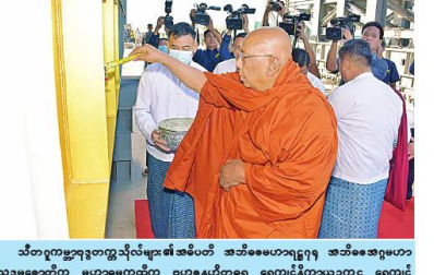
သီတာဂုဏ္ဍာရတနာသီလ်များ၏ အဓိပတိ အဘိဓမ္မဟောဂဠာရ အဘိဓမ္မအဂ္ဂမဟာသဒ္ဓမ္မဇောတိက မဟာမဏ္ဍိုင်က ဗဟုဓနာတရ ဓမ္မကျင့်နိကာယဥက္ကဋ္ဌ ဓမ္မကျင့်သာသနာသီလ်များ၏ အဓိပတိ ခေါက်တာ ဘန္တဂုဏ္ဍာဘိဝံသက ရတနာလွှဲတော်အထောက်အကျိုး သံဃထံစေတင် အား ပရိတ်နံ့သာရည်များ ပက်ဖျန်းပူဇော်၍ သိဒ္ဓိမင်္ဂလာဆင်ယင်စဉ်။