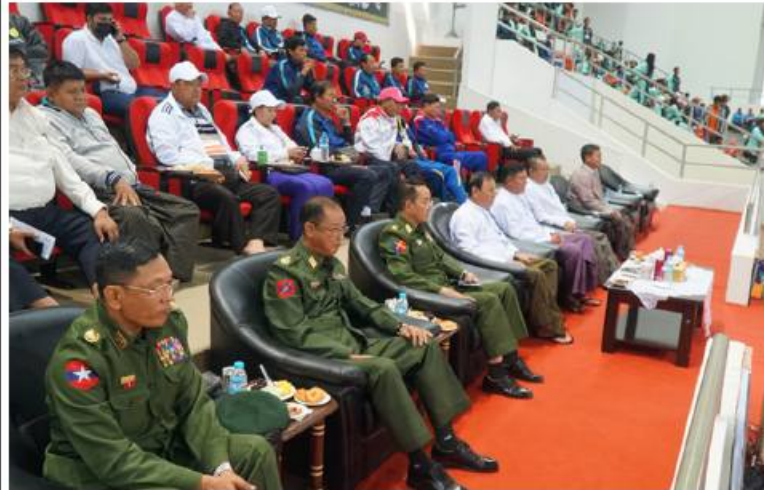
နေပြည်တော် ဇန်နဝါရီ ၂၆

၂၀၂၂-၂၀၂၃ ပညာသင်နှစ် အခြေခံပညာကျောင်းသား အားကစားပွဲတော် ဘော်လီဘော အမျိုးသား၊ အမျိုးသမီး ဗိုလ်လှပွဲစဉ်များကို ယနေ့နံနက်ပိုင်းမှ စတင်၍ ဝဏ္ဏသိဒ္ဓိအားကစားတွင်း(B)ရုံ၌ ဆက်လက်ယှဉ်ပြိုင်ကစားကြရာ အမျိုးသမီးဘော်လီဘောဗိုလ်လှပွဲတွင် တနင်္သာရီတိုင်းဒေသကြီးအသင်းက ဧရာဝတီတိုင်းဒေသကြီးအသင်းကို သုံးပွဲ နှစ်ပွဲဖြင့်လည်းကောင်း၊ အမျိုးသားဘော်လီဘော ဗိုလ်လှပွဲတွင် ရှမ်းပြည်နယ်အသင်းက ဧရာဝတီတိုင်းဒေသကြီးအသင်းကို သုံးပွဲ တစ်ပွဲဖြင့်လည်းကောင်း အနိုင်ရရှိခဲ့ကြောင်း သိရသည်။