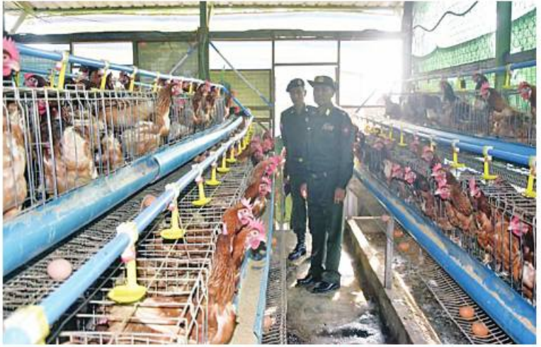
တောင်ပိုင်းတိုင်းစစ်ဌာနချုပ် တိုင်းမှူး ဗိုလ်ချုပ်ထိန်ဝင်း ပဲခူးတပ်နယ် နယ်မြေခံ တပ်ရင်း၌ ဥစားကြက်မွေးမြူထားရုံကို ကြည့်ရှုစစ်ဆေးစဉ်။

၂၅ ရက် နေ့လယ်ပိုင်းတွင် တောင်ပိုင်းတိုင်း စစ်ဌာနချုပ် တိုင်းမှူး ဗိုလ်ချုပ်ထိန်ဝင်းနှင့် တာဝန်ရှိသူများက ပဲခူးတပ်နယ် နယ်မြေခံ တပ်ရင်းရှိ စံပြဘက်စိုက်ပျိုးမွေးမြူရေး မြေသို့ သွားရောက်ကြည့်ရှုစစ်ဆေးပြီး တာဝန်ရှိသူများနှင့်တွေ့ဆုံကာ ကုန်ထုတ် လုပ်ငန်းလုပ်ငန်းများ ရာနှုန်းပြည့်ဆောင်ရွက် ခိုင်ရေးနှင့် လိုအပ်သည်များ ပေါင်းစပ် ညှိနှိုင်းဆောင်ရွက်ပေးခဲ့ကြောင်း သတင်း ရရှိသည်။