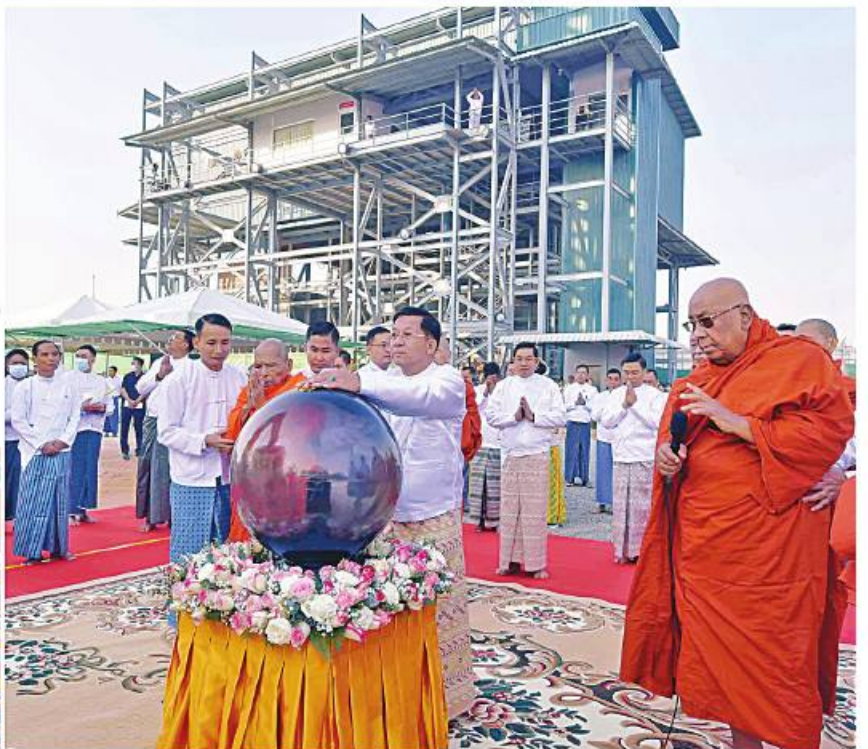
ဦးဆောင်ဘုရားဒါယကာ နိုင်ငံတော်စီမံအုပ်ချုပ်ရေးကောင်စီဥက္ကဋ္ဌ နိုင်ငံတော်ဝန်ကြီးချုပ် ဗိုလ်ချုပ်မှူးကြီးမင်းအောင်လှိုင်က မာရဝိဇယဗုဒ္ဓရုပ်ပွားတော်မြတ်ကြီးကို ရတနာပလ္လင်တော်ထက်သို့ စက်လှေတင်ပို့၍ မင်္ဂလာစက်ယန္တရားများဖြင့် စတင်ပင့်ဆောင်ပူဇော်စဉ်။

နေပြည်တော် ၂၆ ဇန်နဝါရီ ၊ မြေပြင်တော် အကျိုးအမြတ်ကို သိရှိမြို့နယ်ရှိ မာရဝိဇယဗုဒ္ဓရုပ်ပွားတော်အတွင်း တည်ထားကိုးကွယ်ရန် ဆောင်ရွက်လျက်ရှိသည့် မာရဝိဇယဗုဒ္ဓရုပ်ပွားတော်မြတ်ကြီးအား ရတနာပလ္လင်တော်ထက်သို့ စတင်ပင့်ဆောင်ပူဇော်ခြင်း မဟာမင်္ဂလာအခမ်းအနားကို ယနေ့နံနက်ပိုင်းတွင် အဆိုပါဗုဒ္ဓရုပ်ပွားတော်အတွင်း၌ ကျင်းပ