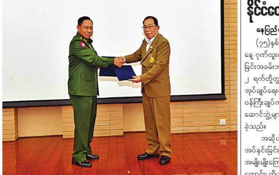
ငြိမ်းချမ်းရေးဆွေးနွေးရေးအဖွဲ့ခေါင်းဆောင် ဒုတိယဗိုလ်ချုပ်ကြီးရာပြည့်နှင့် သျှမ်းပြည်ပြန်လည်ထူထောင်ရေးကောင်စီ(RCSS)ဥက္ကဋ္ဌ ဗိုလ်ချုပ်ကြီးယွက်စစ်တို့ အပြီးသတ်ရရှိလာသည့် သဘောတူညီချက်များကို အတည်ပြုလက်မှတ်ရေးထိုးပြီး အပြန်အလှန်လဲလှယ်စဉ်။

ကောင်း၊ မန္တလေးတိုင်းဒေသကြီးအတွင်းရှိ မြို့နယ် ကိုးမြို့နယ်တို့၌လည်းကောင်း၊ မကွေးတိုင်းဒေသကြီးအတွင်းရှိ မြို့နယ် ၁၀ မြို့နယ်တို့၌ လည်းကောင်း၊ ပဲခူးတိုင်းဒေသကြီးအတွင်းရှိ မြို့နယ် ရှစ်မြို့နယ်နှင့် ကရင်ပြည်နယ် သံတောင်ကြီး၊ မြို့နယ်တို့၌လည်းကောင်း၊ ချွံနွယ်ပေါင်းမြက်များ ခုတ်ထွင် ရှင်းလင်းခြင်း၊ အမှိုက်များရှင်းလင်းခြင်း၊ ရေနုတ်မြောင်းများ တူးဖော်ပေးခြင်း၊ ဘုရား၊ စေတီများနှင့် ရုပ်ပွားတော်များကို ရောင်တော်ဖွင့်ပေးခြင်း၊ ထုံးသင်္ကန်းများ ကပ်လျှူခြင်း စသည့်သန့်ရှင်းရေးလုပ်ငန်းများကို ကုသိုလ်ပြုဆောင်ရွက်ကြသည်။ ယင်းသို့ ဆောင်ရွက်နေမှုများကို သက်ဆိုင်ရာ တိုင်းဒေသကြီးနှင့်ပြည်နယ်များမှ ဝန်ကြီးချုပ်များ၊ တိုင်းစစ်ဌာနချုပ်များမှ တိုင်းမှူးများနှင့် တာဝန်ရှိသူများက သွားရောက်ကြည့်ရှုအားပေးပြီး လိုအပ်သည်များ ပေါင်းစပ်ညှိနှိုင်းဆောင်ရွက်ပေးခဲ့ကြောင်း သတင်းရရှိသည်။