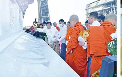
ဦးဆောင်သူရာဇာယကက နိုင်ငံတော်စံနှုန်းရေကောင်းစဉ်ဥက္ကဋ္ဌ နိုင်ငံတော်စံနှုန်းရေကောင်းစဉ်ဥက္ကဋ္ဌ မန္တလေးမြို့ ဝန်ခမ်းကျောင်းတိုက်ဆရာတော် အဘိဓမ္မဟောဂဠာရ အဘိဓမ္မအဂ္ဂမဟာသဒ္ဓမ္မဇောတိက ခေါက်တာ ဘန္တဂုဏ္ဍာဘိဝံသက ရတနာလွှဲတော်အထောက်အကျိုး သံဃထံစေတင် အား ပရိတ်နံ့သာရည်များ ပက်ဖျန်းပူဇော်၍ သိဒ္ဓိမင်္ဂလာဆင်ယင်စဉ်။