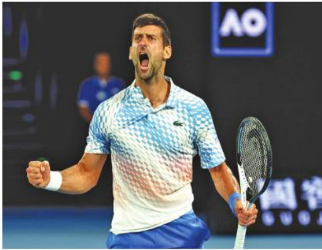
ကင်ဘရာ ဇန်နဝါရီ ၂၆

ဩစတြေးလျနိုင်ငံတွင် ကျင်းပနေသည့် ဩစတြေးလျအိုးပင်းတင်းနစ်ပြိုင်ပွဲ ကွာတားဖိုင်နယ်