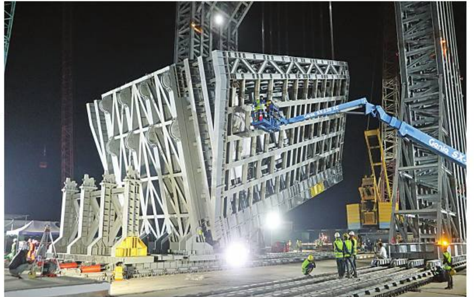
မာရဝိဇယဗုဒ္ဓရုပ်ပွားတော်မြတ်ကြီးအား ဇန်နဝါရီ ၂၆ ရက် ည ၉ နာရီအချိန်အထိ ရတနာပလ္လင်တော်ထက်သို့ ၁၉ ဒီဂရီခန့် ပင့်ဆောင်ပူဇော်ပြီးစီးမှုကို တွေ့ရစဉ်။