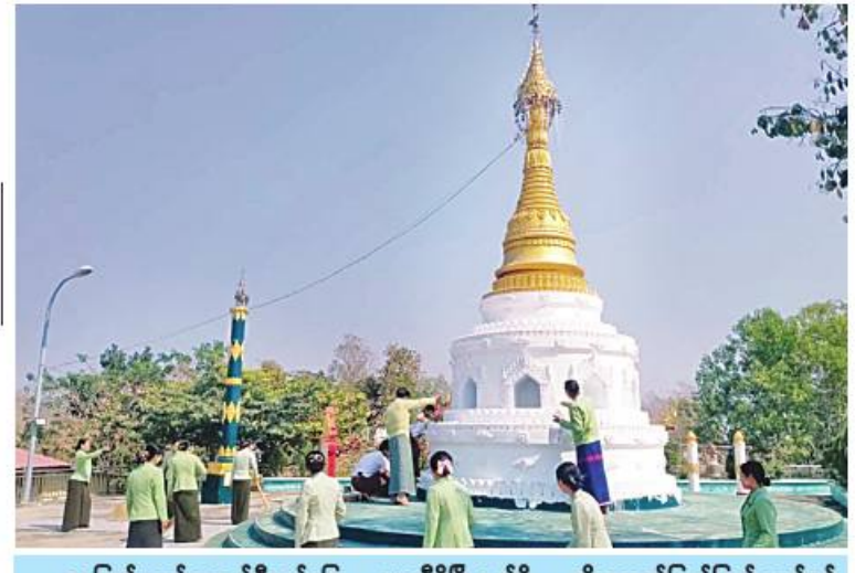
နေပြည်တော်ကောင်စီနယ်မြေ ပုဗ္ဗသီရိမြို့နယ်ရှိ ကိုးတောင်ပြည်ပြည်တော်ဝင် စေတီတော်အား ဌာနဆိုင်ရာတာဝန်ရှိသူများက သန့်ရှင်းရေးနှင့်ထုံးသင်္ကန်းကပ်လျှူစဉ်။

အရှေ့အလယ်ပိုင်း တိုင်းစစ်ဌာနချုပ် တိုင်းမှူး ဗိုလ်ချုပ်မှူးမင်းထွန်း ရှမ်းပြည်နယ် (တောင်ပိုင်း) ဗိုလ်မှူးကြီး ကောင်းမှူးယံ စေတီတော်တွင် နယ်မြေခံ တပ်မတော်သားများက စုပေါင်းသန့်ရှင်းရေး ဆောင်ရွက်နေမှုကို ကြည့်ရှုအားပေးစဉ်။