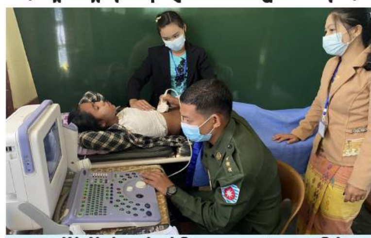
အနောက်ပိုင်းတိုင်းစစ်ဌာနချုပ် နယ်မြေခံဆေးကုသရေးအဖွဲ့က ဒေသခံပြည်သူများကို ကျန်းမာရေးစောင့်ရှောက်မှုလုပ်ငန်းများ ဆောင်ရွက်ပေးစဉ်။

နေပြည်တော် ဇန်နဝါရီ ၂၆ ရခိုင်ပြည်နယ် မင်းပြားမြို့နယ်အတွင်းရှိ သံယာတော်များ၊ သာသနာ့နွယ်ဝင်သီလရှင်များနှင့် ဒေသခံပြည်သူများကို ယနေ့တွင် အနောက်ပိုင်းတိုင်းစစ်ဌာနချုပ် နယ်လှည့်ဆေးကုသရေးအဖွဲ့က မင်းပြားမြို့ရှိ ရာမောင်ခန်းမ၌ ကျန်းမာရေးစောင့်ရှောက်မှုလုပ်ငန်းများ ဆက်လက်ဆောင်ရွက်ပေးသည်။ တိုင်းစစ်ဌာနချုပ် နယ်မြေခံဆေးကုသရေးအဖွဲ့က သံယာတော်များ၊ သာသနာ့နွယ်ဝင်သီလရှင်များနှင့် ဒေသခံပြည်သူ စုစုပေါင်း ၃၁၂၆ ဦးတို့ကို ကျန်းမာရေးစောင့်ရှောက်မှုလုပ်ငန်းများ ဆောင်ရွက်ပေးနိုင်ခဲ့ကြောင်း သတင်းရရှိသည်။