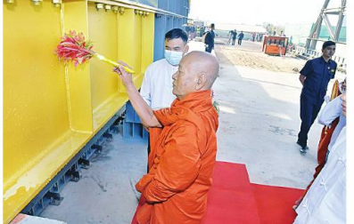
ဆရာတော်ကြီးက ဆင်တုတော်ထည့်သွင်းထားသည့် သံဃထံစေတင် အား ပရိတ်နံ့သာရည်များ ပက်ဖျန်းပူဇော်၍ သိဒ္ဓိမင်္ဂလာဆင်ယင်စဉ်။