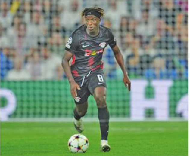
တုံပြန်ခဲ့သည်။

လက်ရှိတွင် ချယ်ဆီးအသင်း နည်းပြ ဂရေဟမ်ပေါ်တာက တပည့်ဟောင်းကာစီဒိုနှင့် ပြန်လည် ပူးပေါင်းနိုင်ရန် ကြိုးပမ်းနေပြီး ပြောင်းရွှေ့ကြေး စတာလင်ပေါင် ၇၅ သန်းဖြင့် ကမ်းလှမ်းခဲ့ရာ ဘရိုက်တန်အသင်း တာဝန်ရှိသူများက ငြင်းပယ်ခဲ့သော်လည်း ကစားသမားအနေဖြင့် ထွက်ခွာရန် ဆန္ဒရှိခဲ့ပါက ပြန်လည်အစားထိုးနိုင်ရန် လိုက်ပလစ်အသင်း ကွင်းလယ်ကစားသမား ဟိုက်ဒါရာကို ခေါ်ယူရန် ကမ်းလှမ်းခဲ့သော်လည်း လိုက်ပလစ်အသင်းက ယခုအပြောင်းအရွှေ့ကာလတွင် ရောင်းချမည်မဟုတ်ကြောင်း ပြန်လည်