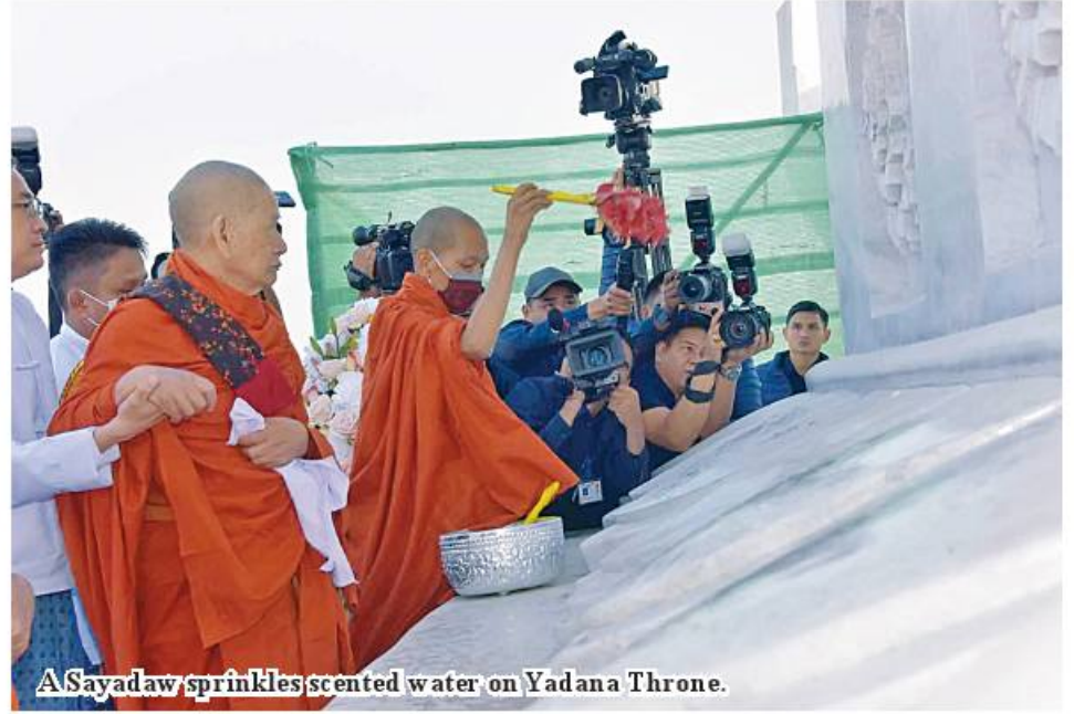
A Sayadaw sprinkles scented water on Yadana Throne.