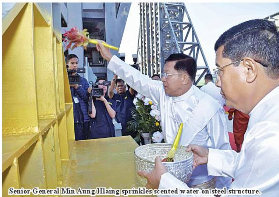
Senior General Min Aung Hlaing sprinkles scented water on steel structure.