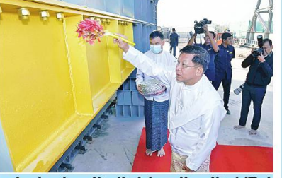
ဦးဆောင်သူရာဇာယကက နိုင်ငံတော်စံနှုန်းရေကောင်းစဉ်ဥက္ကဋ္ဌ နိုင်ငံတော်စံနှုန်းရေကောင်းစဉ်ဥက္ကဋ္ဌ မန္တလေးမြို့ ဝန်ခမ်းကျောင်းတိုက်ဆရာတော် အဘိဓမ္မဟောဂဠာရ အဘိဓမ္မအဂ္ဂမဟာသဒ္ဓမ္မဇောတိက ခေါက်တာ ဘန္တဂုဏ္ဍာဘိဝံသက ရတနာလွှဲတော်အထောက်အကျိုး သံဃထံစေတင် အား ပရိတ်နံ့သာရည်များ ပက်ဖျန်းပူဇော်၍ သိဒ္ဓိမင်္ဂလာဆင်ယင်စဉ်။

မာရဝိဇယ ရုဒ္ဓရုပ်ပွားတော် ပြုတ်ကြီးအား ရတနာလွှဲတော်ထက်သို၊ စတင်ပင့်ဆောင် ပူဇော်ပြီး မဟာမင်္ဂလာ အစမ်းအနားတွင် သံဃမဟာနယကအဖွဲ့ဥက္ကဋ္ဌ မန္တလေးမြို့ ဝန်ခမ်းကျောင်းတိုက်ဆရာတော် အဘိဓမ္မဟောဂဠာရ အဘိဓမ္မအဂ္ဂမဟာသဒ္ဓမ္မဇောတိက ခေါက်တာ ဘန္တဂုဏ္ဍာဘိဝံသက ရတနာလွှဲတော်အထောက်အကျိုး သံဃထံစေတင် အား ပရိတ်နံ့သာရည်များ ပက်ဖျန်းပူဇော်၍ သိဒ္ဓိမင်္ဂလာဆင်ယင်စဉ်။