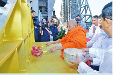
နိုင်ငံတော်သံဃမဟာနယကအဖွဲ့ဥက္ကဋ္ဌ မန္တလေးမြို့ ဝန်ခမ်းကျောင်းတိုက်ဆရာတော် အဘိဓမ္မဟောဂဠာရ အဘိဓမ္မအဂ္ဂမဟာသဒ္ဓမ္မဇောတိက ခေါက်တာ ဘန္တဂုဏ္ဍာဘိဝံသက ရတနာလွှဲတော်အထောက်အကျိုး သံဃထံစေတင် အား ပရိတ်နံ့သာရည်များ ပက်ဖျန်းပူဇော်၍ သိဒ္ဓိမင်္ဂလာဆင်ယင်စဉ်။