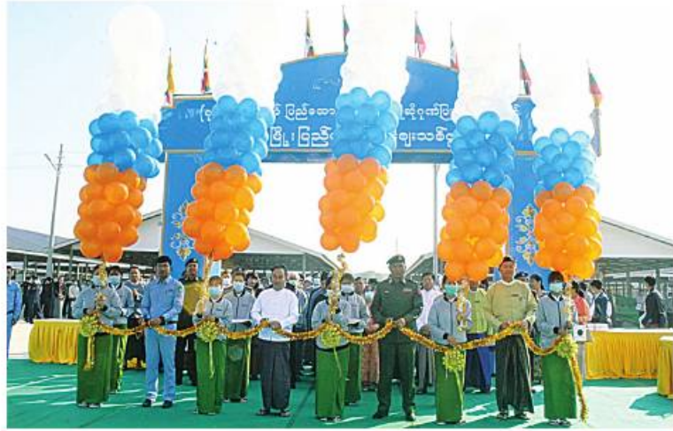
စစ်ကိုင်းတိုင်းဒေသကြီးဝန်ကြီးချုပ် ဦးမြတ်ကျော်နှင့် အနောက်မြောက်တိုင်းစစ်ဌာနချုပ် တိုင်းမှူး ဗိုလ်ချုပ်သန်းထိုက်တို့က ပြည်ထောင်စုဈေးသစ်ကို ဖဲကြီးဖြတ်ဖွင့်ပေးပေးစဉ်။ နေပြည်တော် ဇန်နဝါရီ ၂၆ ကြိုဆိုဂုဏ်ပြုသောအားဖြင့် မုံရွာမြို့ (၇၆)နှစ်မြောက် ပြည်ထောင်စုနေ့ကို လယ်တီရပ်ကွက်ရှိ ပြည်ထောင်စုဈေးသစ်

ဖွင့်ပွဲကို ယနေ့ နံနက်ပိုင်းတွင် အဆိုပါ ဈေးသစ် မှန်ပုံနှိပ်ပြုလုပ်ရာ စစ်ကိုင်း တိုင်းဒေသကြီးဝန်ကြီးချုပ် ဦးမြတ်ကျော်၊ အနောက်မြောက်တိုင်းစစ်ဌာနချုပ် တိုင်းမှူး ဗိုလ်ချုပ်သန်းထိုက်၊ ဌာနဆိုင်ရာတာဝန်ရှိ သူများနှင့် ရပ်ကွက်နေပြည်သူများ တက်ရောက်ကြသည်။ ဦးစွာ တိုင်းဒေသကြီးဝန်ကြီးချုပ်က အဖွင့်အမှာစကား ပြောကြားသည်။ ထို့နောက် မြို့နယ်စည်ပင်သာယာရေးအဖွဲ့မှ တာဝန်ရှိသူတစ်ဦးက ဈေးသစ်နှင့်ပတ်သက် သည့် အချက်အလက်များကို ရှင်းလင်း တင်ပြသည်။ ယင်းနောက် တိုင်းဒေသကြီး ဝန်ကြီးချုပ်၊ တိုင်းမှူးနှင့် တာဝန်ရှိသူများက ပြည်ထောင်စုဈေးသစ်ကို ဖဲကြီးဖြတ် ဖွင့်လှစ်ပေးပြီး လိုက်လံကြည့်ရှုစစ်ဆေး ခဲ့ကြောင်း သတင်းရရှိသည်။