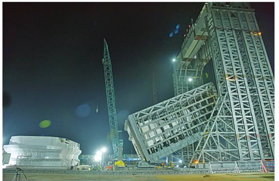
မာရဝိဇယဗုဒ္ဓရုပ်ပွားတော်မြတ်ကြီးအား ဇန်နဝါရီ ၂၆ ရက် ည ၁၁ နာရီအချိန်အထိ ရတနာပလ္လင်တော်ထက်သို့ ၂၃ ဒီဂရီခန့် ပင့်ဆောင်ပူဇော်ပြီးစီးမှုကို တွေ့ရစဉ်။