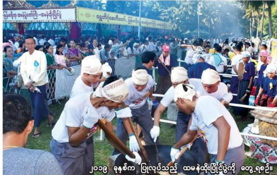
၂၀၁၉ ရန်ကင်း ပြုလုပ်သည့် ထမနဲထိုးပြိုင်ပွဲကို တွေ့ရစဉ်။