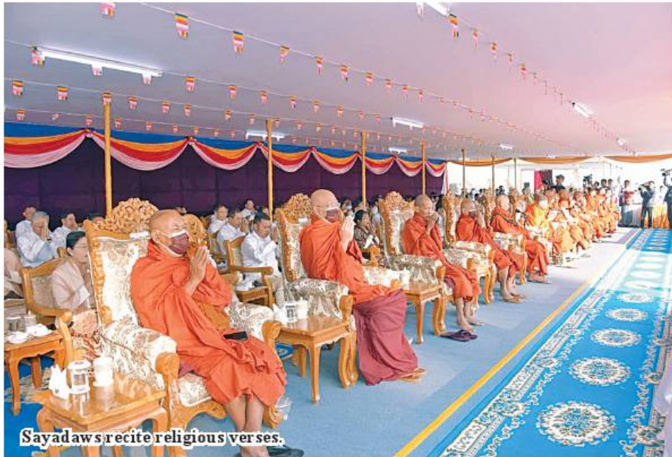
Sayadaws recite religious verses.