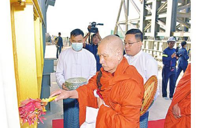
ဆရာတော်ကြီးက ဆင်တုတော်ထည့်သွင်းထားသည့် သံဃထံစေတင် အား ပရိတ်နံ့သာရည်များ ပက်ဖျန်းပူဇော်၍ သိဒ္ဓိမင်္ဂလာဆင်ယင်စဉ်။