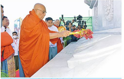
သီတာဂုဏ္ဍာရတနာသီလ်များ၏ အဓိပတိ အဘိဓမ္မဟောဂဠာရ အဘိဓမ္မအဂ္ဂမဟာသဒ္ဓမ္မဇောတိက မဟာမဏ္ဍိုင်က ဗဟုဓနာတရ ဓမ္မကျင့်နိကာယဥက္ကဋ္ဌ ဓမ္မကျင့်သာသနာသီလ်များ၏ အဓိပတိ ခေါက်တာ ဘန္တဂုဏ္ဍာဘိဝံသက ရတနာလွှဲတော်အထောက်အား ပရိတ်နံ့သာရည်များ ပက်ဖျန်းပူဇော်၍ သိဒ္ဓိမင်္ဂလာဆင်ယင်စဉ်။