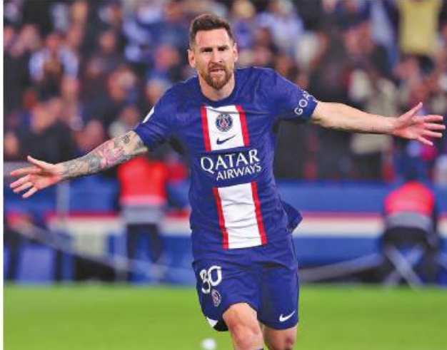
မက်ဆီ ဇန်နဝါရီ ၂၆

ပီအက်စ်ဂျီအသင်းက အသင်းတိုက်စစ်ကစားသမား မက်ဆီကို သက်တမ်းတိုးစာချုပ် ချုပ်ဆိုရန် ကြိုးပမ်းလျက်ရှိသော်လည်း မက်ဆီကိုယ်တိုင်က ပီအက်စ်ဂျီအသင်း၏ သက်တမ်းတိုးစာချုပ်အတွက်