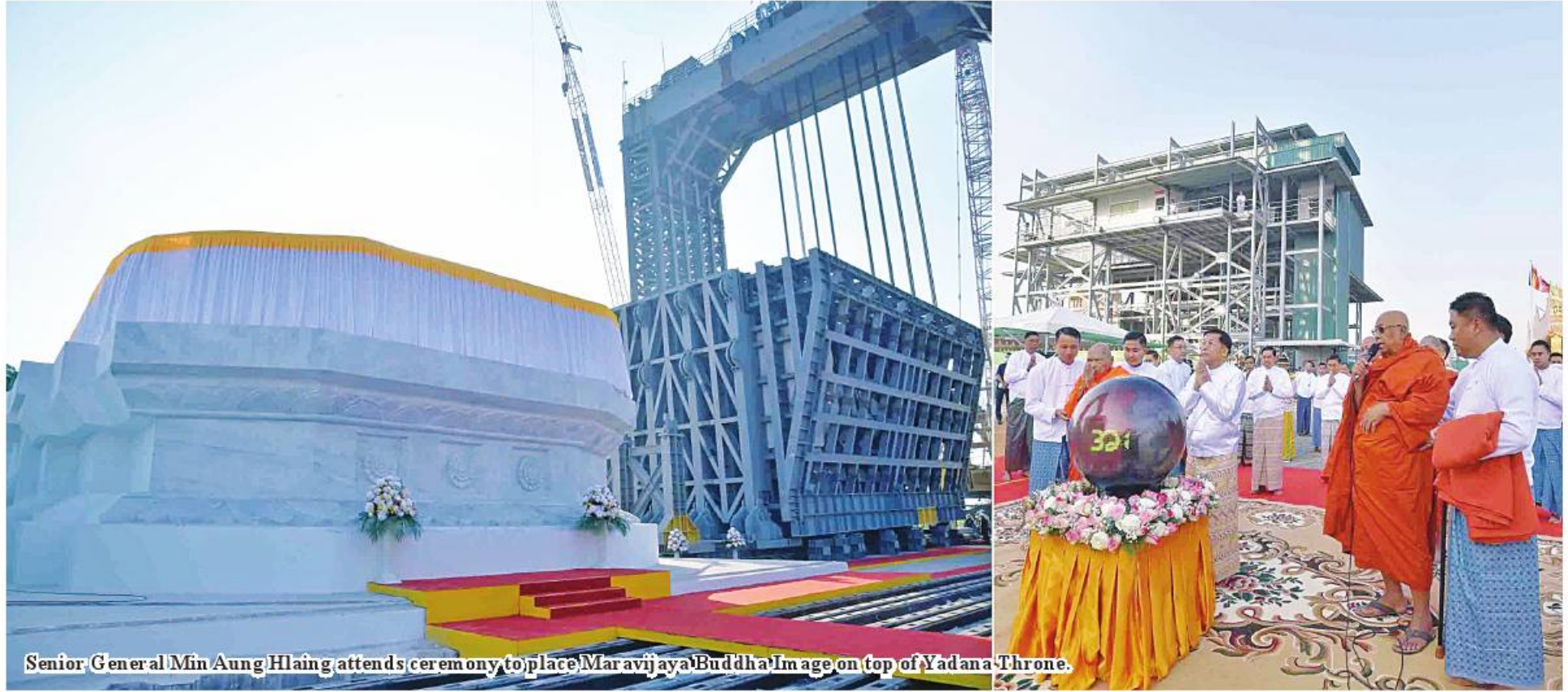
Senior General Min Aung Hlaing attends ceremony to place Maravijaya Buddha Image on top of Yadana Throne.

Nay Pyi Taw January 26 A holy and auspicious ceremony to put the Maravijaya Buddha Image on top of the Yadana Throne was held this morning at Buddha Park in Dekkhinathiri Township, Nay Pyi Taw, Union Territory, where the image will be placed.