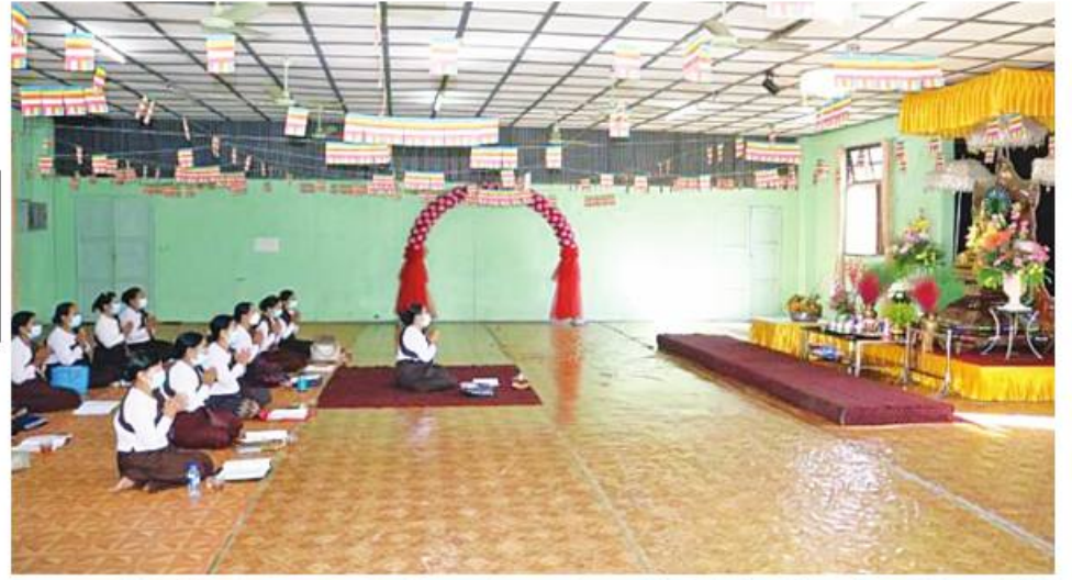
အလယ်ပိုင်းတိုင်းစစ်ဌာနချုပ် တပ်တွင်းဓမ္မာရုံ၌ အတွင်းအောင်မြင်ရုံခမ်း၊ ပါဠိတော်၊ အပြင်အောင်မြင်ရုံခမ်း၊ ပါဠိတော်နှင့် ပရိတ်ကြီး ၁၁ သုတ်မှ ဓမ္မဂုဏ်များ ရွတ်ဖတ်ပူဇော်ကြစဉ်။

နေပြည်တော် ဇန်နဝါရီ ၂၆ နိုင်ငံတော် အေးချမ်းသာယာစေရန်၊ နိုင်ငံတစ်ဝန်း ဘေးအန္တရာယ်ကင်းရှင်းစေရန်နှင့် ပြည်သူများ စိတ်ကြည်နူးအေးချမ်းစေရန်ရည်ရွယ်၍ တပ်မတော်သားများနှင့် မိသားစုဝင်များ၊ မြန်မာနိုင်ငံရဲတပ်ဖွဲ့ဝင်များနှင့် မိသားစုဝင်များ၊ ဌာနဆိုင်ရာ အသီးသီးမှ ဝတ်ရွတ်အသင်းများက သက်ဆိုင်ရာတိုင်းဒေသကြီးနှင့် ပြည်နယ်အသီးသီးရှိ ဓမ္မာရုံများ၊ စေတီပုထိုးများ၊ ဘုန်းတော်ကြီးကျောင်းများ၌ မြတ်စွာဘုရားရှင်အားရည်မှန်း၍ အတွင်းအောင်မြင်ရုံခမ်း၊ အပြင်အောင်မြင်ရုံခမ်းပါဠိတော်၊ ဓမ္မဂုဏ်အပါအဝင် အန္တရာယ်ကင်း ပရိတ်တရားတော်များ၊ ပဋ္ဌာန်းဒေသနာတော်များနှင့် ဇယမင်္ဂလာဂါထာတော်များကို ရွတ်ဖတ်ပူဇော်လျက် ရှိသည်။