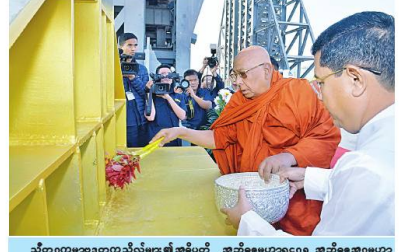
သီတာဂုဏ္ဍာရတနာသီလ်များ၏ အဓိပတိ အဘိဓမ္မဟောဂဠာရ အဘိဓမ္မအဂ္ဂမဟာသဒ္ဓမ္မဇောတိက မဟာမဏ္ဍိုင်က ဗဟုဓနာတရ ဓမ္မကျင့်နိကာယဥက္ကဋ္ဌ ဓမ္မကျင့်သာသနာသီလ်များ၏ အဓိပတိ ခေါက်တာ ဘန္တဂုဏ္ဍာဘိဝံသက ရတနာလွှဲတော်အထောက်အကျိုး သံဃထံစေတင် အား ပရိတ်နံ့သာရည်များ ပက်ဖျန်းပူဇော်၍ သိဒ္ဓိမင်္ဂလာဆင်ယင်စဉ်။