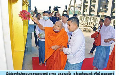
နိုင်ငံတော်သံဃမဟာနယကအဖွဲ့ဥက္ကဋ္ဌ မန္တလေးမြို့ ဝန်ခမ်းကျောင်းတိုက်ဆရာတော် အဘိဓမ္မဟောဂဠာရ အဘိဓမ္မအဂ္ဂမဟာသဒ္ဓမ္မဇောတိက ခေါက်တာ ဘန္တဂုဏ္ဍာဘိဝံသက ရတနာလွှဲတော်အထောက်အကျိုး သံဃထံစေတင် အား ပရိတ်နံ့သာရည်များ ပက်ဖျန်းပူဇော်၍ သိဒ္ဓိမင်္ဂလာဆင်ယင်စဉ်။