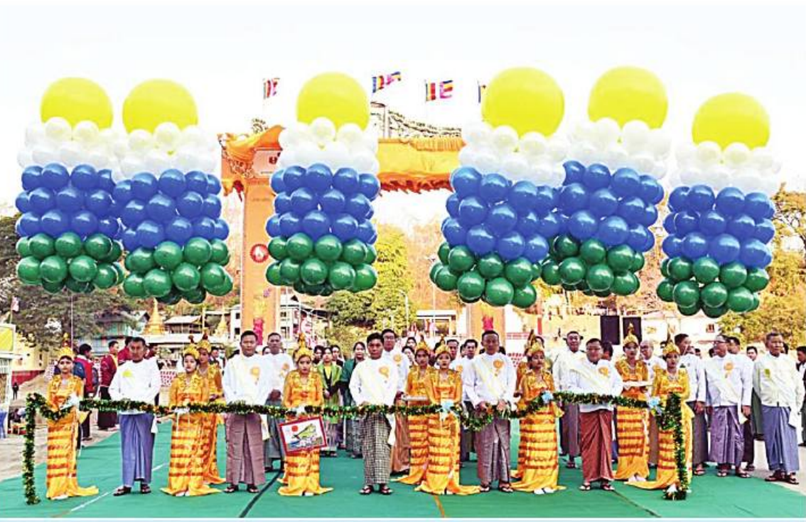
အလယ်ပိုင်းတိုင်းစစ်ဌာနချုပ် တိုင်းမှူး၊ ဗိုလ်ချုပ်ကိုကိုဦးနှင့် တာဝန်ရှိသူများက အထူးတံတားနှင့် အထူးမုခ်ဦးကို မဲကြိုမြတ်ဖွင့်လှစ်ပေးစဉ်။

နေပြည်တော် ၈နိုဝင်ဘာ ၂၅ မကွေးတိုင်းဒေသကြီး မင်းဘူး(စက) မြို့နယ် မန်းရွှေစက်တော်ရာဘုရား ပါဒစေတီတော် ပုဒ္ဂိုလ်နိယပွဲတော်ဖွင့်ပွဲ မင်္ဂလာအခမ်းအနား၊ အထူးတံတားနှင့် အထူးမုခ်ဦးပွင့်လှစ်ခြင်း မင်္ဂလာအခမ်းအနားကို ယနေ့နံနက်ပိုင်းတွင် ကျင်းပပြုလုပ်သည်။ အဆိုပါအခမ်းအနားသို့ မင်းဘူးမြို့ အမှတ်(၂)ရပ်ကွက် မဟာဝိသုတာရာမတိုက်သစ်ပဓာနနာယက နိုင်ငံတော်ဗဟိုသံယာဝန်ဆောင်ဆရာတော် ဘဒ္ဒန္တဉာဏိက အမျိုးပြုသော သံဃာတော်များကြွရောက်တော်မူကြပြီး တိုင်းဒေသကြီးဝန်ကြီးချုပ် ဦးတင်လွင်၊ အလယ်ပိုင်းတိုင်းစစ်ဌာနချုပ် တိုင်းမှူး ဗိုလ်ချုပ်ကိုကိုဦး၊ တိုင်းဒေသကြီး ဝန်ကြီးများ၊ ဌာနဆိုင်ရာ တာဝန်ရှိသူများ၊ ဘာသာရေးအသင်းအဖွဲ့များ၊ စာမျက်နှာ ၁၈ ကော်လံ ၁ ☆