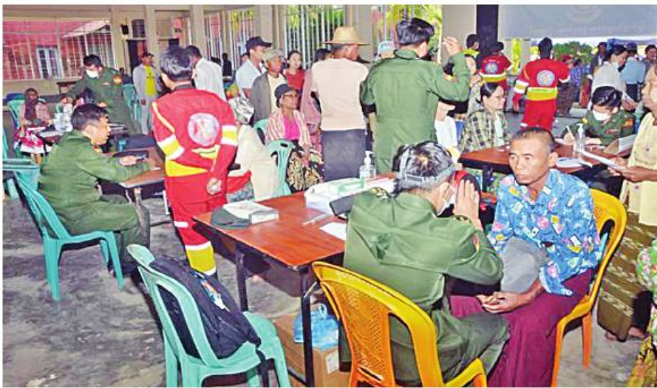
တပ်မတော် ဖြစ်တွင်းသွား ဆေးရုံရေယာဉ် (ရွှေပုဇွန်)နှင့် မြစ်ရေယာဉ်(စက) တို့မှ မြောင်းမြမြို့နယ် တောင်ကလေး ကျေးရွာနှင့် ပတ်ဝန်းကျင် ကျေးရွာများရှိ ဒေသခံပြည်သူများကို ကျန်းမာရေး စောင့်ရှောက်မှု လုပ်ငန်းများ ဆောင်ရွက်ပေးစဉ်။

နေပြည်တော် ဇန်နဝါရီ ၂၅ ရောဂါတိုင်းဒေသကြီး ရောဂါတို မြစ်ကြောင်းတစ်လျှောက်ရှိ မြစ်ဝကျွန်းပေါ် ကျေးရွာများမှ ဒေသခံပြည်သူများကို ကျန်းမာရေးစောင့်ရှောက်မှု လုပ်ငန်းများ ဆောင်ရွက်ပေးရန် ရောက်ရှိနေသော တပ်မတော်နယ်လှည့်အထူးကုဆေးအဖွဲ့မှ ပါရဂူများ၊ ဆေးမှူးများနှင့် သူနာပြုများ ပါဝင်သော တပ်မတော်ဖြစ်တွင်းသွား ဆေးရုံရေယာဉ်(ရွှေပုဇွန်)နှင့် မြစ်ရေယာဉ် (စက)တို့သည် ယနေ့တွင် မြောင်းမြမြို့နယ်