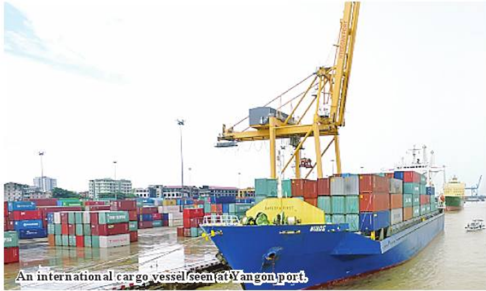
An international cargo vessel seen at Yangon port.

Yangon January 25 The Ministry of Transport and Communications stated that international ports of Yangon admitted more than 200 international cargo vessels and handled over 100,000 containers from January to December 2022 rather than last year. A total of 27 international ports are located in Yangon wharves and 19 at Thilawa terminal area, totaling 46 in Yangon Region. These international ports