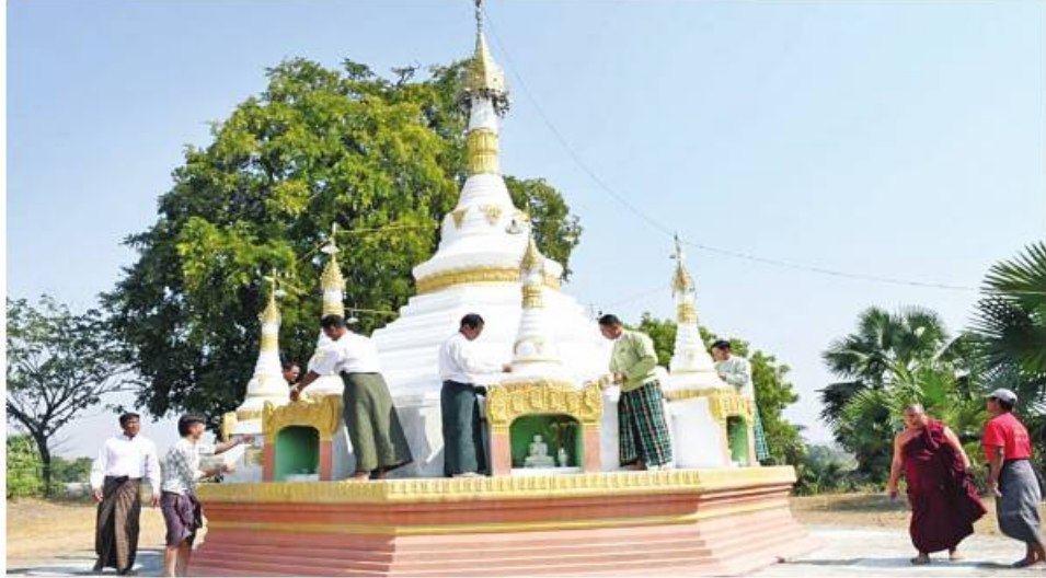
နေပြည်တော်ကောင်စီနယ်မြေ ပုဗ္ဗသီရိမြို့နယ် ကိုးတောင်ပြည့်ပြည်တော်ဝင်စေတီတော်၌ ဌာနဆိုင်ရာတာဝန်ရှိသူများက သန့်ရှင်းရေးပြုလုပ်၍ ထူးသကန်းကပ်လျှာစဉ်။

တာဝန်ရှိသူများ၊ တိုင်းစစ်ဌာနချုပ်များမှ တာဝန်ရှိသူများက သွားရောက်ကြည့်ရှုအားပေးပြီး လိုအပ်သည်များပေါင်းစပ်ညှိနှိုင်းဆောင်ရွက်ပေးခဲ့ကြောင်း သတင်းရရှိသည်။