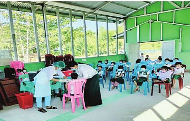
ဧရာဝတီတိုင်းဒေသကြီး ကန်ကြီးထောင့်မြို့ရှိ ကျောင်းသား၊ ကျောင်းသူများကို ကိုဗစ်-၁၉ ရောဂါကာကွယ်ဆေးထိုးနှံပေးစဉ်။

ယင်းသို့ ဆောင်ရွက်ပေးနေမှုများကို သက်ဆိုင်ရာတိုင်းစစ်ဌာနချုပ်များမှ တိုင်းမှူးများနှင့်တာဝန်ရှိသူများက သွားရောက်ကြည့်ရှုအားပေးပြီး အာဟာရဖြည့်စားသောက်ဖွယ်ရာများ၊ အားကစားပစ္စည်းများနှင့် ထောက်ပံ့ပေးပေးခဲ့ကြကြောင်း သတင်းရရှိသည်။