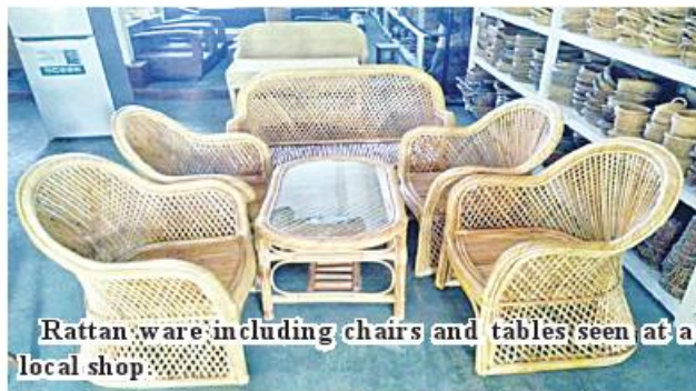
Rattan ware including chairs and tables, seen at a local shop