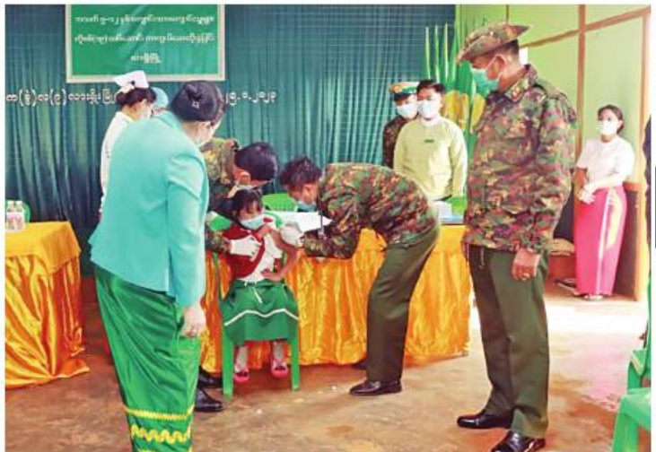
အရှေ့မြောက်တိုင်းစစ်ဌာနချုပ် တိုင်းမှူး၊ ဗိုလ်ချုပ်နိုင်နိုင်ဦး၊ အသက် ငါးနှစ်မှ အသက် ၁၂ နှစ်ကြား ကျောင်းသား၊ ကျောင်းသူများအား ကိုဗစ်-၁၉ ရောဂါ ထပ်ဆောင်းကာကွယ်ဆေးထိုးနှံပေးနေမှုကို ကြည့်ရှုအားပေးစဉ်။

ဆေးများထိုးနှံပေးလျက်ရှိရာ ယနေ့တွင် ရှမ်းပြည်နယ်(မြောက်ပိုင်း) လားရှိုးမြို့၌ ကျောင်းသား၊ ကျောင်းသူ ၉၅၂ ဦး၊ ဧရာဝတီတိုင်းဒေသကြီးအတွင်းရှိ မြို့နယ် ၂၆မြို့နယ်တို့၌ ကျောင်းသား၊ ကျောင်းသူ ၂၀၅၆ ဦးနှင့် မန္တလေးတိုင်းဒေသကြီးအတွင်းရှိ ခရိုင် ခုနစ်ခုတို့၌ ကျောင်းသား၊ကျောင်းသူ ဦးရေ ၂၇၇၈၀ တို့ကို တပ်မတော်မှ ဆေးအဖွဲ့များက ပြည်သူ့ဆေးရုံများမှ ဆရာဝန်များ၊ သက်ဆိုင်ရာကျန်းမာရေးဝန်ထမ်းများ၊ စေတနာ့ဝန်ထမ်းများနှင့် ပူးပေါင်း၍ ကိုဗစ်-၁၉ ရောဂါကာကွယ်ဆေးထိုးနှံပေးခြင်းများ ဆောင်ရွက်ပေးသည်။