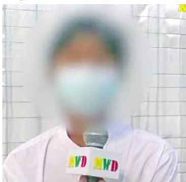
ဟိုမှာနေရတာအဆင်မပြေလို့ ဒုက္ခ ပေါင်းစုံရောက်တယ်။ တောထဲမှာစားရတာ လည်းအဆင်မပြေဘူး။ အစစအရာရာ ဘာမှအဆင်မပြေဘူး။ အစကတော့ ကောင်းမယ်ထင်လို့သွားခဲ့တာ။ ကြီးနိုင် ငယ်ညှဉ်းပုံစံဖြစ်နေတယ်။ သူတို့အကြီးတွေ

ပြောကြားသည်။ ယခုကဲ့သို့ ဥပဒေဘောင်အတွင်း ဝင်ရောက်လာသော PDF အဖွဲ့ဝင်များ၏ ရင်တွင်းစကားသံများကို ယခုလိုကြား သိရပါတယ်- ဟိုမှာနေရတာအဆင်မပြေလို့ ဒုက္ခ ပေါင်းစုံရောက်တယ်။ တောထဲမှာစားရတာ လည်းအဆင်မပြေဘူး။ အစစအရာရာ ဘာမှအဆင်မပြေဘူး။ အစကတော့ ကောင်းမယ်ထင်လို့သွားခဲ့တာ။ ကြီးနိုင် ငယ်ညှဉ်းပုံစံဖြစ်နေတယ်။ သူတို့အကြီးတွေ