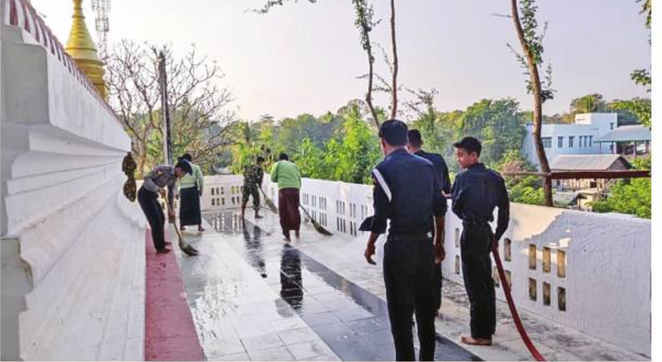
မန္တလေးတိုင်းဒေသကြီး သပိတ်ကျင်းမြို့နယ် ကဘုံရပ်ကွက် ကမ္ဘာအေးဆုတောင်းပြည့်ဘုရား၌ တပ်မတော်သားများ၊ မြန်မာနိုင်ငံရဲတပ်ဖွဲ့ဝင်များနှင့်မီးသတ်တပ်ဖွဲ့ဝင်များက စုပေါင်းသန့်ရှင်းရေးဆောင်ရွက်စဉ်။