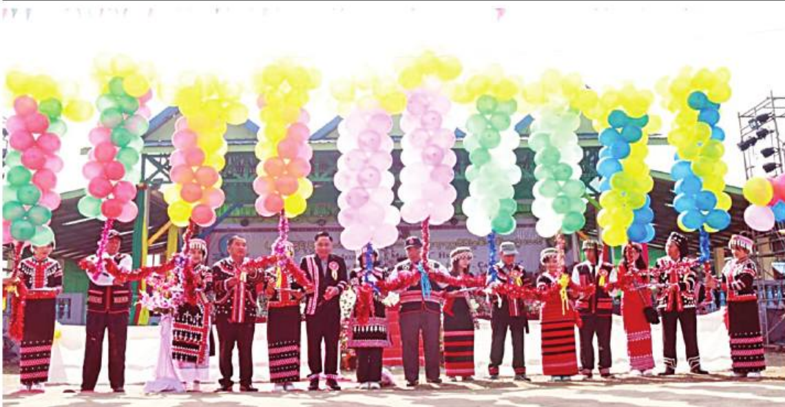
ရှမ်းပြည်နယ်ဝန်ကြီးချုပ် ဒေါက်တာကျော်ထွန်း၊ ကြိမ်မြောက် မိုင်းဆတ်ခရိုင်နှင့် မိုင်းတုံခရိုင် ဌာနဆိုင်ရာတာဝန်ရှိသူများက (၂၀)ကြိမ်မြောက် မိုင်းဆတ်ခရိုင်နှင့်မိုင်းတုံခရိုင် လားဟူတိုင်းရင်းသားစုပေါင်းနှစ်သစ်ကူးပွဲတော်ကို ဖဲကြီးဖြတ်ဖွင့်လှစ်ပေးစဉ်။

သွန်းဖျန်းကာ ရွှေသင်္ကန်းတော်များ ကပ်လျှူပူဇော်ကြသည်။ ယင်းနောက် သံဃာတော်အရှင်သူမြတ်များက အထက်စက်တော်ရာ ပါဒစေတီတော်မြတ်အား ဗုဒ္ဓါဘိသေကအနေကဇာတင်တော်မူပြီး ဗုဒ္ဓသာသနံစိရံတိဋ္ဌတု သုံးကြိမ်ရွတ်ဆိုဆုတောင်း၍ အခမ်းအနားကို အောင်မြင်စွာရပ်သိမ်းခဲ့သည်။ ထို့နောက် သုံးထပ်သာသနာပိမာန်တွင် မန်းရွှေစက်တော်ရာဘုရား ပါဒစေတီတော်နှစ်ဆူ ဖွင့်လှစ်ပူဇော်ပွဲ အောင်မြင်ခြင်းအတွက် ဒါန၊ သီလ၊ ဘာဝနာကုသိုလ်ဆည်းပူးခြင်းနှင့် လျှာဒါနမူအစုစုတို့အတွက် ရေစက်သွန်းချအမျှပေးဝေခြင်းအခမ်းအနား ကျင်းပ၍ သံဃာတော်အရှင်သူမြတ်တို့ကို နေ့ဆွမ်းဆက်ကပ်လျှူဒါန်းကြသည်။ ထို့နောက် တိုင်းဒေသကြီးဝန်ကြီးချုပ်၊ တိုင်းမှူးနှင့် တာဝန်ရှိသူများသည် မင်းဘူးသစ်ထုတ်ရေးဒေသ၊ ရွှေစက်တော်မန်းချောင်းဆင်စခန်း လေးနှစ်ပြည့်အထိမ်းအမှတ်အခမ်းအနားသို့သွားရောက်၍ ဆင်သရုပ်ပြ (Elephant Show) အစီအစဉ်များကို ကြည့်ရှုအားပေးကာ ဆင်ကလေးများကို အစားအစာများ ကျွေးမွေးခဲ့ကြသည်။ အဆိုပါ မန်းရွှေစက်တော်ရာ ပါဒစေတီတော် ဗုဒ္ဓပူဇော်ပွဲတော်ကို ဇန်နဝါရီ ၂၅ ရက်မှ ဧပြီ ၁၇ ရက်ထိ ၈၃ ရက်တိုင်တိုင် ကျင်းပသွားမည်ဖြစ်ကြောင်း သတင်းရရှိသည်။