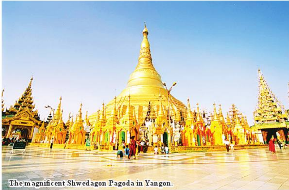
The magnificent Shwedagon Pagoda in Yangon.

Yangon January 25 Board of Trustees will invite private entrepreneurs to purchase gold foils through a competitive tender system to be used in the gold foils of Shwedagon Pagoda in 2023, according to reports of the Shwedagon Pagoda's