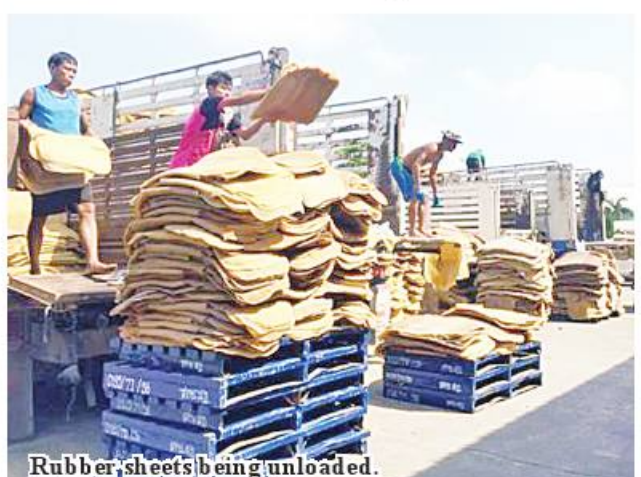
Rubber sheets being unloaded.