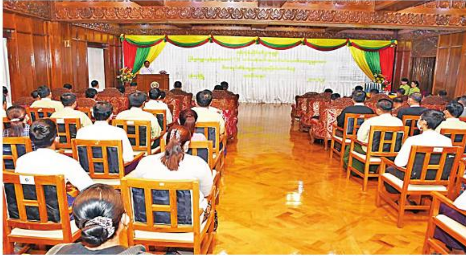
ရန်ကုန်တိုင်းဒေသကြီး ဝန်ကြီးချုပ် ဦးစိုးသိန်း ဥပဒေဘောင်အတွင်း ဝင်ရောက်လာသည့် ပြစ်မှုကျူးလွန်ခြင်း မရှိခဲ့သော PDF အဖွဲ့ဝင်များကို ၎င်းတို့၏ မိဘအုပ်ထိန်းသူများထံ ပြန်လည်လွှဲပြောင်း ပေးအပ်ပွဲတွင် အမှာစကား ပြောကြားစဉ်။

နေပြည်တော် ဇန်နဝါရီ ၂၅ တိုင်းရင်းသား လက်နက်ကိုင်အဖွဲ့ နယ်မြေအတွင်း သင်တန်းများတက်ရောက် ခဲ့ပြီး ပြစ်မှုကျူးလွန်ခြင်းမရှိခဲ့သည့် ဥပဒေ ဘောင်အတွင်းဝင်ရောက်လာသော PDF အဖွဲ့ဝင်များကို ပြန်လည်ကြိုဆိုလက်ခံ၍ ၎င်းတို့၏ မိဘအုပ်ထိန်းသူများထံသို့ လွှဲပြောင်းပေးအပ်လျက်ရှိသည်။ ယနေ့နံနက်ပိုင်းတွင်လည်း ရန်ကုန် တိုင်းဒေသကြီးအစိုးရအဖွဲ့ရုံး မင်္ဂလာဒုံမ ဌာန ပြန်လည်ကြိုဆိုလက်ခံခြင်းကို ပြုလုပ်ရာ တိုင်းဒေသကြီးဝန်ကြီးချုပ် ဦးစိုးသိန်း၊ ရန်ကုန်တိုင်းစစ်ဌာနချုပ် တိုင်းမှူး ဝိုင်းလှိုင်ညွန့်ဝင်းဆွေနှင့် အဖွဲ့ဝင်များ၊ တိုင်းဒေသကြီးဝန်ကြီးများ၊ ဌာနချုပ်ရာ တာဝန်ရှိသူများ၊ ဥပဒေဘောင်အတွင်း ဝင်ရောက်လာသူများနှင့် ၎င်းတို့၏ မိဘအုပ်ထိန်းသူများ တက်ရောက် ကြသည်။ ဦးစွာ တိုင်းဒေသကြီးဝန်ကြီးချုပ်က အမှာစကားပြောကြားပြီး တိုင်းမှူးက