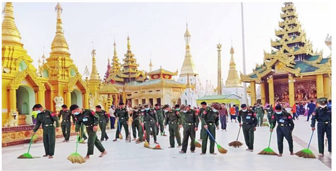
ရန်ကုန်တိုင်းဒေသကြီး ဒဂုံမြို့နယ်ရှိ ရွှေတိဂုံစေတီတော်မြတ်ကြီး ရင်ပြင်တော်ပေါ်၌ ရန်ကုန်တိုင်းစစ်ဌာနချုပ် ကွပ်ကဲမှုအောက်ရှိ နယ်မြေခံတပ်မတော်သားများက စုပေါင်းသန့်ရှင်းရေးလုပ်ငန်းများဆောင်ရွက်ပေးစဉ်။

ရှိ မြို့နယ် ၁၄ မြို့နယ်တို့၌လည်းကောင်း၊ ရှမ်းပြည်နယ်(တောင်ပိုင်း) အတွင်းရှိ မြို့နယ် သုံးမြို့နယ်တို့၌လည်းကောင်း၊ ရှမ်းပြည်နယ်(အရှေ့ပိုင်း)အတွင်းရှိ မြို့နယ် ကိုးမြို့နယ်တို့၌လည်းကောင်း၊ မွန်ပြည်နယ်အတွင်းရှိ မြို့နယ် သုံးမြို့နယ်တို့၌လည်းကောင်း၊ ကရင်ပြည်နယ် လှိုင်းဘွဲ့မြို့နယ်တို့၌လည်းကောင်း၊ တနင်္သာရီတိုင်းဒေသကြီး မြိတ်မြို့ လေးကျွန်းဆီမီးစေတီတော်မြတ်ကြီး၌လည်းကောင်း၊ ရန်ကုန်တိုင်းဒေသကြီးအတွင်းရှိ မြို့နယ် ရှစ်မြို့နယ်တို့၌လည်းကောင်း၊ ဧရာဝတီတိုင်းဒေသကြီးအတွင်းရှိ မြို့နယ်လေးမြို့နယ်တို့၌လည်းကောင်း၊ ရခိုင်ပြည်နယ်အတွင်းရှိ မြို့နယ် ၁၂ မြို့နယ်တို့၌လည်းကောင်း၊ စစ်ကိုင်းတိုင်းဒေသကြီးအတွင်းရှိ မြို့နယ် ၁၀မြို့နယ်တို့၌လည်းကောင်း၊ မန္တလေးတိုင်းဒေသကြီးအတွင်းရှိ မြို့နယ် ၁၂ မြို့နယ်တို့၌လည်းကောင်း၊ မကွေးတိုင်းဒေသကြီးအတွင်းရှိ မြို့နယ် ခြောက်မြို့နယ်တို့၌လည်းကောင်း၊ ပဲခူးတိုင်းဒေသကြီးတောင်ငူမြို့ရှိ နန်းတော်ဦးလောကမာရင်နိစေတီမြတ်ကြီး၌လည်းကောင်း၊ ချုံနွယ်