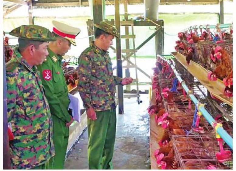
မြောက်ပိုင်းတိုင်းစစ်ဌာနချုပ် တိုင်းမှူး ဗိုလ်ချုပ်ကိုကိုမောင် မြစ်ကြီးနားမြို့ရှိ နယ်မြေခံတပ်ရင်း စိုက်ပျိုးမွေးမြူရေးမြေတွင် ဥစားကြက်များ မွေးမြူထားရှိမှုကို ကြည့်ရှုစစ်ဆေးစဉ်။

ဗိုလ်ချုပ်ကိုကိုမောင်နှင့် တာဝန်ရှိသူများက တိုင်းစစ်ဌာနချုပ် နယ်မြေခံတပ်ရင်း၊ တပ်ဖွဲ့များမှ စိုက်ပျိုးရေးဆောင်ရွက်ထားရှိမှုအခြေအနေများ၊ ဥစားကြက်၊ အသားစားကြက်၊ DYL ဝက်၊ နို့စားခွားနှင့် ဆိတ်မွေးမြူထားရှိမှုတို့ကို သွားရောက်ကြည့်ရှုစစ်ဆေးပြီး တာဝန်ရှိသူများနှင့် တွေ့ဆုံကာ ကုန်ထုတ်လုပ်မှုလုပ်ငန်းများ ရာနှုန်းပြည့်ဆောင်ရွက်နိုင်ရေးနှင့် လိုအပ်သည်များ ပေါင်းစပ်ညှိနှိုင်းဆောင်ရွက်ပေးခဲ့ကြောင်း သတင်းရရှိသည်။