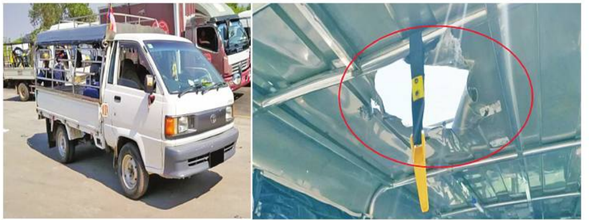
အကြမ်းဖက်သမားများ၏ ပစ်ခတ်မှုကြောင့် ဘုရားပူးမော်တော်ယာဉ်ပျက်စီးခဲ့မှု မှတ်တမ်းဓာတ်ပုံ။