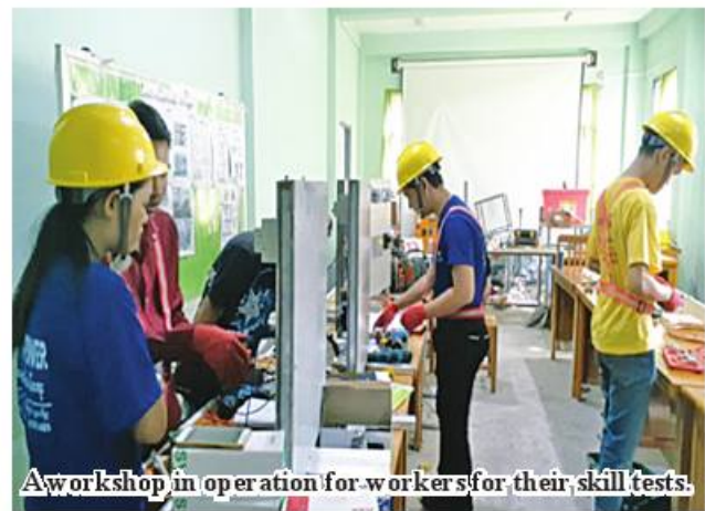
A workshop in operation for workers for their skill tests.

all five candidates passed it. SA has issued certificates of skills to the workers who passed the respective level tests. 336