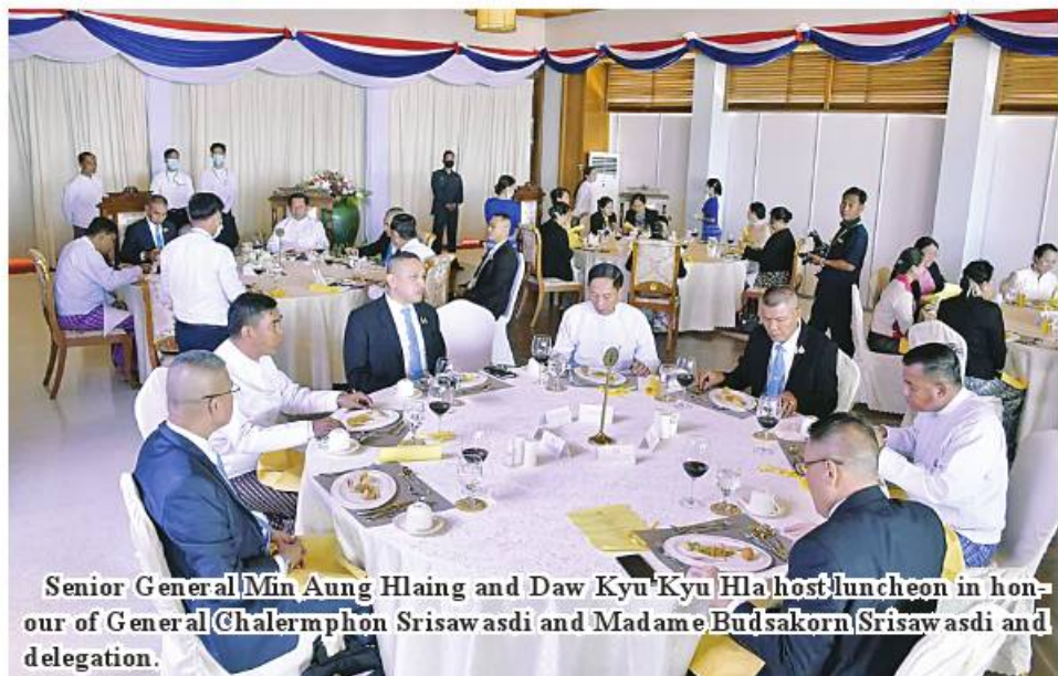
Senior General Min Aung Hlaing and Daw Kyu Kyu Hla host luncheon in honour of General Chalermphon Srisawasdi and Madame Budsakorn Srisawasdi and delegation.

After the meeting, the Senior General and wife hosted luncheon for the delegation led by the Thai General and wife. 100