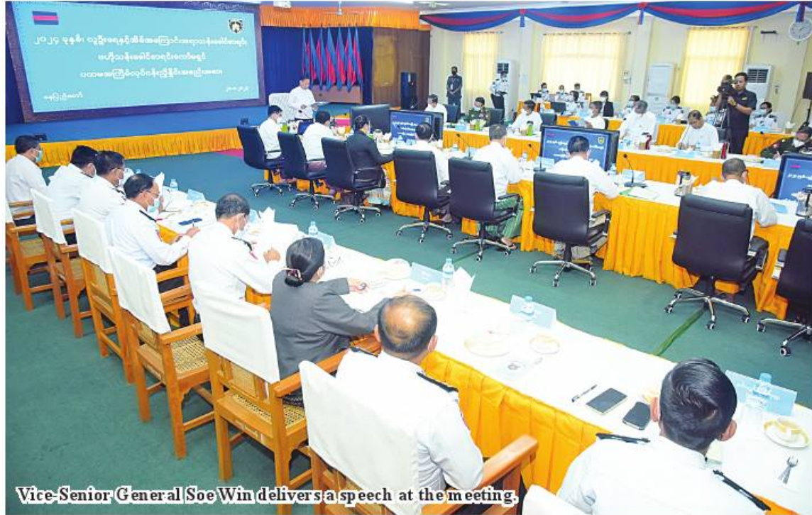
Vice-Senior General Soe Win delivers a speech at the meeting.