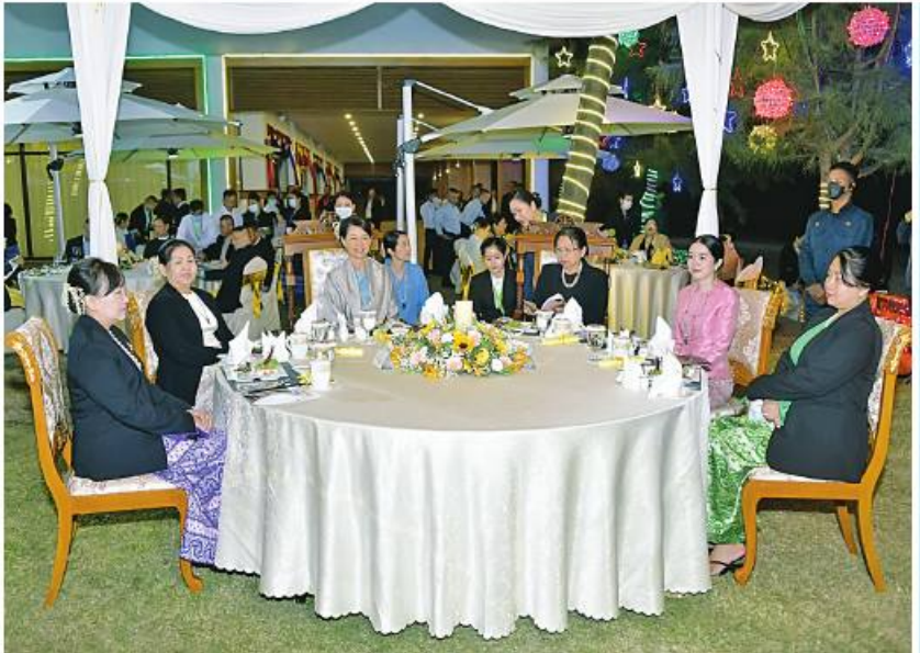
နိုင်ငံတော် စီမံအုပ်ချုပ်ရေးကောင်စီဥက္ကဋ္ဌ တပ်မတော် ကာကွယ်ရေးဦးစီးချုပ် ဝိုင်းချုပ်မှူးကြီးမင်းအောင်လှိုင် နှင့် ဇနီး ဒေါ်ကြူကြူလှတို့က ထိုင်းဘုရင့်တပ်မတော် ကာကွယ်ရေးဦးစီးချုပ် General Chalermphon Srisawasdi နှင့် ဇနီး Madame Budsakorn Srisawasdi ဦးဆောင်သည့် ကိုယ်စားလှယ်အဖွဲ့ကို ဂုဏ်ပြုညစာဖြင့် တည်ခင်းညှော်ခံခဲ့။