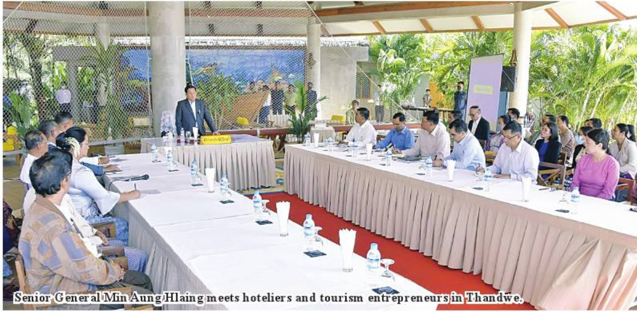
Senior General Min Aung Hlaing meets hoteliers and tourism entrepreneurs in Thandwe.

Nay Pyi Taw January 20 Chairman of the State Administration Council Prime Minister Senior General Min Aung Hlaing this afternoon met with hotels and tourism entrepreneurs at Pristine Mermaid Resort in Thandwe of Rakhine State and discussed improvement of tourism industry and development of the region.