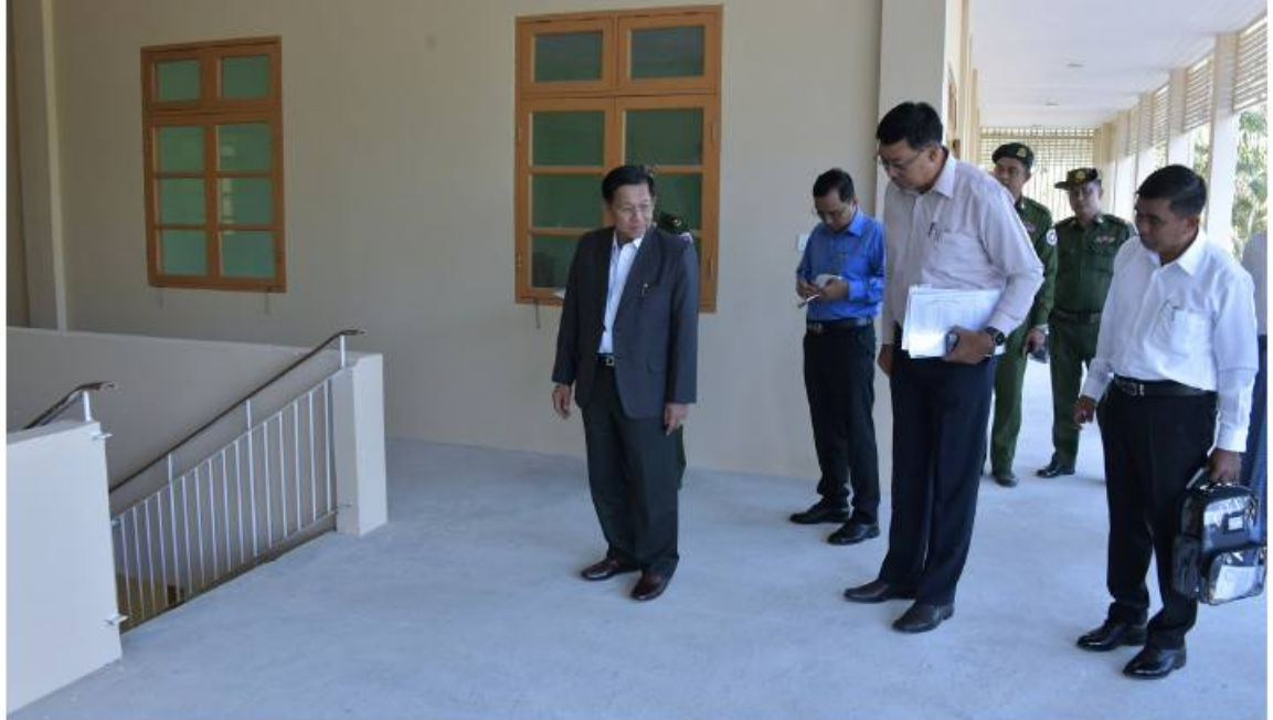
နိုင်ငံတော်စီမံအုပ်ချုပ်ရေးကောင်စီဥက္ကဋ္ဌ နိုင်ငံတော်ဝန်ကြီးချုပ် ဗိုလ်ချုပ်မှူးကြီးမင်းအောင်လှိုင် သံတွဲမြို့ရှိ အောင်စစ်သည် အပန်းဖြေစခန်း(လင်းသာ) တည်ဆောက်ထားရှိမှုအခြေအနေများကို ကြည့်ရှုစစ်ဆေးစဉ်။

ဒေသတွင်းရှိ ရွေးဟောင်းအမွေအနှစ် များ၊ ထိန်းသိမ်းစောင့်ရှောက်ရန် လိုအပ် သည့် အဆောက်အအုံများ၊ ဘာသာရေး အဆောက်အအုံများအားလုံး သန့်ရှင်း သာယာလှပစေရေး၊ မိမိတို့နေထိုင်ရာ ပတ်ဝန်းကျင်နှင့် လမ်းများအားလုံးသန့်ရှင်း သပ်ရပ်မှုရှိစေရေး၊ အမြင်တင့်တယ်မှုရှိစေ ရေး ဒေသအလိုက်တာဝန်ရှိသူများနှင့်