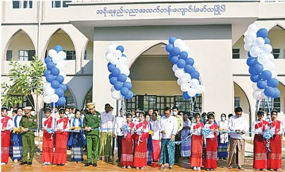
အစိုးရနည်းပညာအထက်တန်းကျောင်း(မော်လမြိုင်)

ဖွန်ပြည်နယ် ဝန်ကြီးချုပ် ဦးစော်လင်းထွန်း၊ အရှေ့တောင်တိုင်း ဝန်ကြီးချုပ် တိုင်းမှူး ဗိုလ်ချုပ် မြတ်သက်ဦးနှင့် တာဝန်ရှိသူများက ကျောင်းဆောင်သစ်ကို ဖဲကြီးဖြတ် ဖွင့်လှစ်ပေးခဲ့။