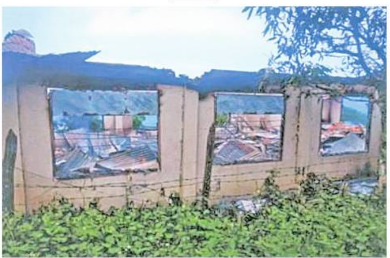
မီးရှို့ဖျက်ဆီးခြင်းခံထားရသည့် တီးတိန်မြို့နယ်ဦးစီးရုံးရုံး အဆောက်အအုံ၏ မုတ်တမ်းဓာတ်ပုံ။