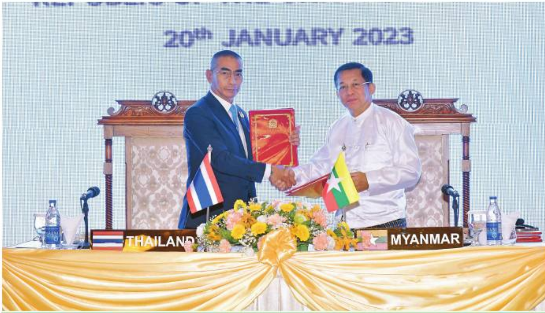
နိုင်ငံတော်စီမံအုပ်ချုပ်ရေးကောင်စီဥက္ကဋ္ဌ တပ်မတော်ကာကွယ်ရေးဦးစီးချုပ် ဗိုလ်ချုပ်မှူးကြီးမင်းအောင်လှိုင်နှင့် ထိုင်းဘုရင့် တပ်မတော်ကာကွယ်ရေးဦးစီးချုပ် General Chalermphon Srisawasdi တို့ (၈)ကြိမ်မြောက် မြန်မာ-ထိုင်း တပ်မတော် နှစ်နိုင်ငံအကြား အဆင့်မြင့်အရာရှိကြီးများအစည်းအဝေး သဘောတူညီချက်များကို အတည်ပြုလက်မှတ်ရေးထိုး လဲလှယ်ကြစဉ်။

နိုင်ငံတော်စီမံအုပ်ချုပ်ရေးကောင်စီ ဥက္ကဋ္ဌ တပ်မတော်ကာကွယ်ရေးဦးစီးချုပ် ဗိုလ်ချုပ်မှူးကြီးမင်းအောင်လှိုင်နှင့် ဇနီး ဒေါ်ကြူကြူလှတို့က မြန်မာနိုင်ငံမှာ အိမ်ရှင်အဖြစ်လက်ခံကျင်းပပြုလုပ်တဲ့ မြန်မာ- ထိုင်း တပ်မတော်နှစ်ရပ်အကြား အဆင့်မြင့်အရာရှိကြီးများအစည်းအဝေး 8 th High Level Committee Meeting သို့တက်ရောက်ရန်ရောက်ရှိနေတဲ့ ထိုင်း ဘုရင့်တပ်မတော်ကာကွယ်ရေးဦးစီးချုပ် General Chalermphon Srisawasdi နှင့် ဇနီး ဦးဆောင်တဲ့ကိုယ်စားလှယ်အဖွဲ့ဝင်တွေကို ဇန်နဝါရီ ၁၉ ရက် ညပိုင်းတွင် ရခိုင်ပြည်နယ် သံတွဲမြို့၊ ငပလီကမ်းခြေ Pristine Mermaid Resort ၌ ညစာစားပွဲဖြင့် ကြိုဆိုဧည့်ခံခဲ့ပါတယ်။