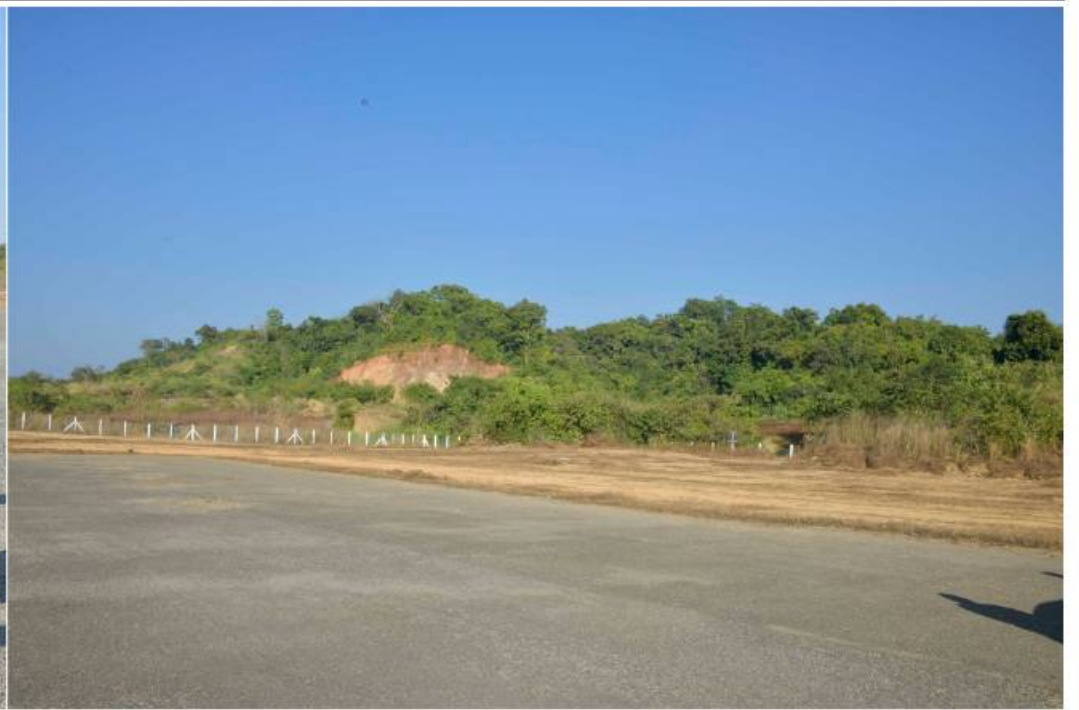
နိုင်ငံတော်စီမံအုပ်ချုပ်ရေးကောင်စီဥက္ကဋ္ဌ နိုင်ငံတော်ဝန်ကြီးချုပ် ဗိုလ်ချုပ်မှူးကြီးမင်းအောင်လှိုင် လေယာဉ်ပြေးလမ်းတစ်လျှောက် လှည့်လည်ကြည့်ရှုပြီး လေယာဉ်ကွင်းအဆင့်မြှင့်တင်ဆောင်ရွက်နိုင်မည့် အခြေအနေများကို ကြည့်ရှုစဉ်။

စာမျက်နှာ ၂၀ မှအဆက် ဒေသခံများက ဝိုင်းဝန်းထိန်းသိမ်းဆောင်ရွက်ကြရန်လိုကြောင်း၊ ဒေသသို့လာရောက်လည်ပတ်သူများ စိတ်နှလုံးချမ်းမြေ့ပြီး မျက်စိပသာဒဖြစ်စေရေးအတွက် Green Zone များကိုလည်း ဖန်တီးပေးရန်လိုကြောင်း၊ ထိုသို့ ဆောင်ရွက်ထားရှိခြင်းအားဖြင့် ဒေသတွင်းသို့လာရောက်လည်ပတ်သူများ ဝင်ရောက်မှုပိုမိုများပြားလာပြီး ဒေသတွင်း ငွေကြေးလည်ပတ်မှုအားကောင်းလာမည်ဖြစ်ကာ ဒေသဖွံ့ဖြိုးတိုးတက်မှုကို ဖြစ်ပေါ်စေမည်ဖြစ်ကြောင်း၊ အိမ်သာယာမှသာလျှင် ဧည့်လာမည်ဖြစ်ကြောင်း။ ဒေသတွင်းတာဝန်ကျသည့် အုပ်ချုပ်ရေးဆိုင်ရာတာဝန်ရှိသူများအနေဖြင့် ဒေသဖွံ့ဖြိုးတိုးတက်ရေးနှင့် သာယာလှပရေးတို့အတွက် စည်းကမ်းပိုင်းဆိုင်ရာများကို ဥပဒေနှင့်အညီ တိကျစွာကိုင်တွယ်ဆောင်ရွက်ရန်လိုကြောင်း၊ ဒေသနှင့် တိုင်းပြည်၏ ရေရှည်အကျိုးကိုကြည့်၍ မိမိ၏တာဝန်များကိုကျေပွန်အောင် တိတိကျကျဖြင့် အမှန်းခံပြောဆိုဆောင်ရွက်သွားကြရန်လိုကြောင်း၊ ဥပဒေမဲ့ဆောင်ရွက်နေမှုများကို ပြောဆိုသတိပေးရမည်များကို ဆောင်ရွက်