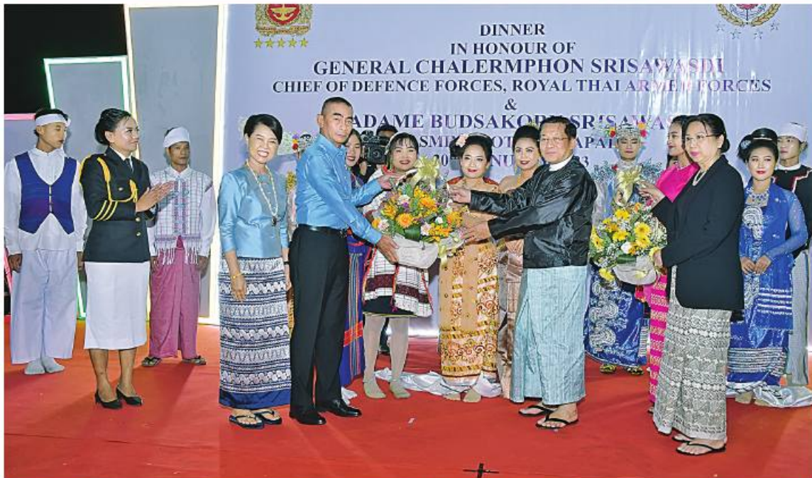
နိုင်ငံတော်စီမံအုပ်ချုပ်ရေးကောင်စီဥက္ကဋ္ဌ တပ်မတော်ကာကွယ်ရေးဦးစီးချုပ် ဗိုလ်ချုပ်မှူးကြီးမင်းအောင်လှိုင်နှင့်ဇနီး ဒေါ်ကြူကြူလှ၊ ထိုင်းဘုရင့်တပ်မတော်ကာကွယ်ရေးဦးစီးချုပ် General Chalermpthon Srisawasdi နှင့် ဇနီး Madame Budsakorn Srisawasdi တို့က သီဆိုကပြဖျော်ဖြေခဲ့ကြသည့် အနုပညာရှင်များကို ဂုဏ်ပြုပန်းခြံနှင့် ဂုဏ်ပြုချီးမြှင့်ငွေများပေးအပ်စဉ်။