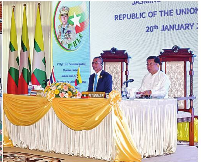
(၈)ကြိမ်မြောက် မြန်မာ-ထိုင်းတပ်မတော်နှစ်ရပ်အကြား အဆင့်မြင့်အရာရှိကြီးများအစည်းအဝေး၏ မြန်မာဘက်ပူးတွဲဥက္ကဋ္ဌဖြစ်သူ နိုင်ငံတော်စီမံအုပ်ချုပ်ရေးကောင်စီဥက္ကဋ္ဌ တပ်မတော်ကာကွယ်ရေးဦးစီးချုပ် ဗိုလ်ချုပ်မှူးကြီးမင်းအောင်လှိုင်က အဖွင့်အမှာစကားပြောကြားစဉ်။

နေပြည်တော် စန်နိုဝါရီ ၂၀ မြန်မာနိုင်ငံ၌ အိမ်ရှင်အဖြစ် လက်ခံကျင်းပ ပြုလုပ်သည့် (၈)ကြိမ်မြောက် မြန်မာ-ထိုင်း တပ်မတော်နှစ်ရပ်အကြား အဆင့်မြင့်အရာရှိကြီး များအစည်းအဝေး 8 th High Level Committee Meeting ကို ယနေ့နံနက်ပိုင်းတွင် ရခိုင်ပြည် နယ် သံတွဲမြို့ရှိ Jasmine Ngapali Resort ၌ ကျင်းပပြုလုပ်သည်။ အစည်းအဝေးမစတင်မီ အစည်းအဝေးသို့ နိုင်ငံတော်စီမံအုပ်ချုပ်ရေးကောင်စီ ဥက္ကဋ္ဌ တပ်မတော်ကာကွယ်ရေးဦးစီးချုပ် ဗိုလ်ချုပ်မှူးကြီး မင်းအောင်လှိုင်နှင့် ထိုင်းဘုရင့်တပ်မတော် ကာကွယ်ရေးဦးစီးချုပ် General Chalermpchon Srisawasdi တို့သည် သီးခြားတွေ့ဆုံ၍ တပ်မတော်နှစ်ရပ်အကြား ရှေ့ဆက်ဆောင်ရွက် မည့်ကိစ္စရပ်များကို ဆွေးနွေးကြသည်။ ထို့နောက် (၈)ကြိမ်မြောက် မြန်မာ-ထိုင်း တပ်မတော်နှစ်ရပ်အကြား အဆင့်မြင့်အရာရှိကြီး များအစည်းအဝေးကို ကျင်းပပြုလုပ်ရာ နိုင်ငံတော် စီမံအုပ်ချုပ်ရေးကောင်စီဥက္ကဋ္ဌ တပ်မတော် ကာကွယ်ရေးဦးစီးချုပ် ဗိုလ်ချုပ်မှူးကြီး မင်းအောင်လှိုင်၊ ထိုင်းဘုရင့်တပ်မတော်ကာကွယ် ရေးဦးစီးချုပ် General Chalermpchon Srisawasdi တို့နှင့်အတူ ညှိနှိုင်းကွပ်ကဲရေးမှူး (ကြည်း၊ ရေ၊ လေ) ဗိုလ်ချုပ်ကြီးမောင်မောင်အေး၊ စာချက်နာ ၁၆ ကော်လံ ၁ ဖြ