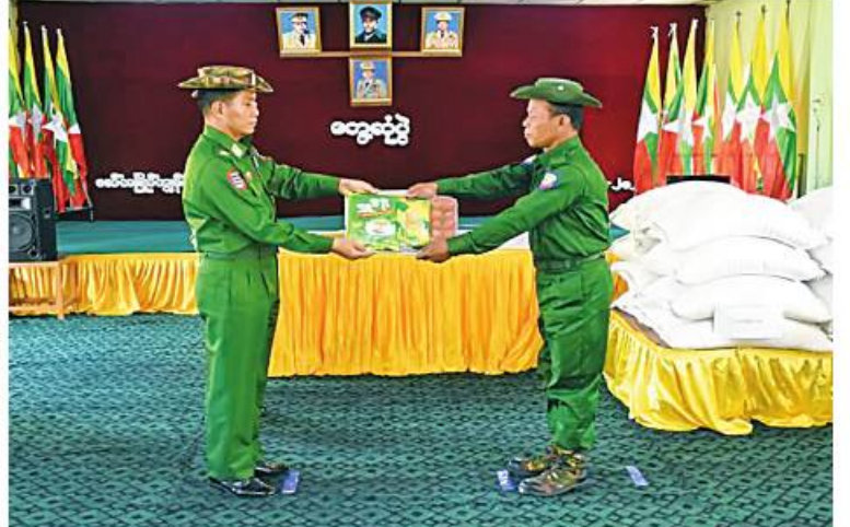
အနောက်တောင်တိုင်းစစ်ဌာနချုပ် တိုင်းမှူး ဗိုလ်မှူးချုပ်ကြည်ခိုင် ပြည်သူ့စစ် (ဌာန)တပ်ဖွဲ့ဝင်များကို စားသောက်ဖွယ်ရာများ ထောက်ပံ့ပေးအပ်ခဲ့။

နေပြည်တော် ဇန်နဝါရီ ၂၀ ရှမ်းပြည်နယ်(တောင်ပိုင်း) လင်းခေး မြို့ရှိ စစ်မှုထမ်းဟောင်းအဖွဲ့ဝင်များကို ယနေ့နံနက်ပိုင်းတွင် အရှေ့အလယ်ပိုင်း တိုင်းစစ်ဌာနချုပ် တိုင်းမှူး ဗိုလ်ချုပ် မျိုးမင်းထွန်းက နယ်မြေခံတပ်ရင်းခန်းမ၌ သွားရောက်တွေ့ဆုံသည်။ တွေ့ဆုံရာတွင် တိုင်းမှူးက အမှာစကား ပြောကြားပြီး စစ်မှုထမ်းဟောင်းအဖွဲ့ဝင် များ၏ တင်ပြချက်များအပေါ် လိုအပ် သည်များ ညှိနှိုင်းဆောင်ရွက်ပေးသည်။ ထို့နောက် စစ်မှုထမ်းဟောင်းအဖွဲ့ဝင်များ အတွက် ဆန်နှင့် စားသောက်ဖွယ်ရာများ