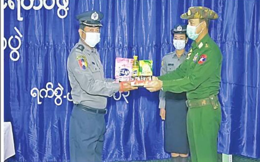
ကာကွယ်ရေးဦးစီးချုပ်ရုံး (ကြည်း)မှ ဒုတိယဗိုလ်ချုပ်ကြီး အောင်အောင် ကွတ်ခိုင်မြို့ရှိ မြန်မာနိုင်ငံရဲတပ်ဖွဲ့ဝင်များနှင့် မိသားစုဝင်များအတွက် စားသောက်ဖွယ်ရာများနှင့် လူသုံးကုန်ပစ္စည်းများ ထောက်ပံ့ပေးအပ်စဉ်။

နေပြည်တော် ဇန်နဝါရီ ၂၀ ရှမ်းပြည်နယ်(မြောက်ပိုင်း) ကွတ်ခိုင်မြို့နယ်အတွင်း လုံခြုံရေးဆောင်ရွက်နေသော မြန်မာနိုင်ငံရဲတပ်ဖွဲ့ဝင်များနှင့် မိသားစုဝင်များကို ယနေ့ နေ့လယ်ပိုင်းတွင် ကာကွယ်ရေးဦးစီးချုပ်ရုံး(ကြည်း)မှ ဒုတိယဗိုလ်ချုပ်ကြီးအောင်အောင်၊ အရှေ့မြောက်တိုင်းစစ်ဌာနချုပ် တိုင်းမှူး ဗိုလ်ချုပ် နိုင်နိုင်ဦးနှင့် ဌာနဆိုင်ရာ တာဝန်ရှိသူများက ကွတ်ခိုင်မြို့ရှိ ခရိုင်ရဲတပ်ဖွဲ့မှူးရုံး၌ သွားရောက်တွေ့ဆုံသည်။ တွေ့ဆုံရာတွင် ကာကွယ်ရေးဦးစီးချုပ်ရုံး(ကြည်း)မှ ဒုတိယဗိုလ်ချုပ်ကြီးအောင်အောင်က မြန်မာနိုင်ငံရဲတပ်ဖွဲ့ဝင်များနှင့် မိသားစုဝင်များအတွက် စားသောက်ဖွယ်ရာများနှင့် လူသုံးကုန်ပစ္စည်းများ ထောက်ပံ့ပေးအပ်ရာ ခရိုင်ရဲတပ်ဖွဲ့မှူးက လက်ခံရယူသည်။