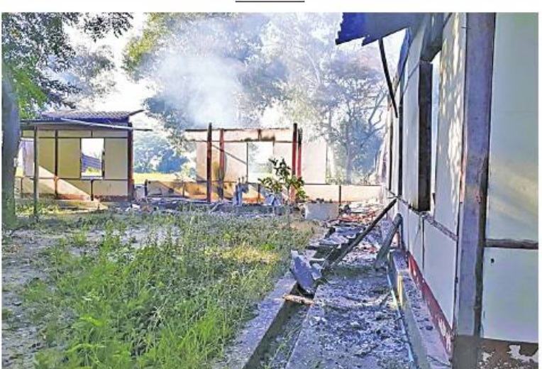
မီးရှို့ဖျက်ဆီးခြင်းခံထားရသည့် ဒီပဲယင်းမြို့နယ်ဦးစီးရုံးရုံး အဆောက်အအုံ၏ မုတ်တမ်းဓာတ်ပုံ။