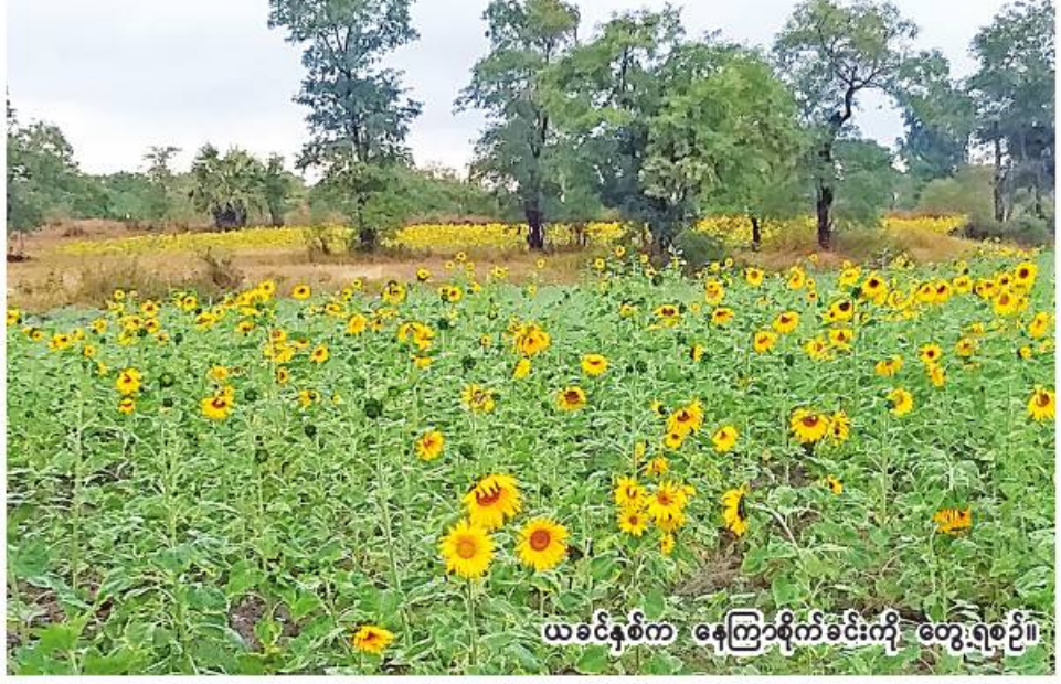
ယခင်နှစ်က နေကြာစိုက်ခင်းကို တွေ့ရစဉ်။