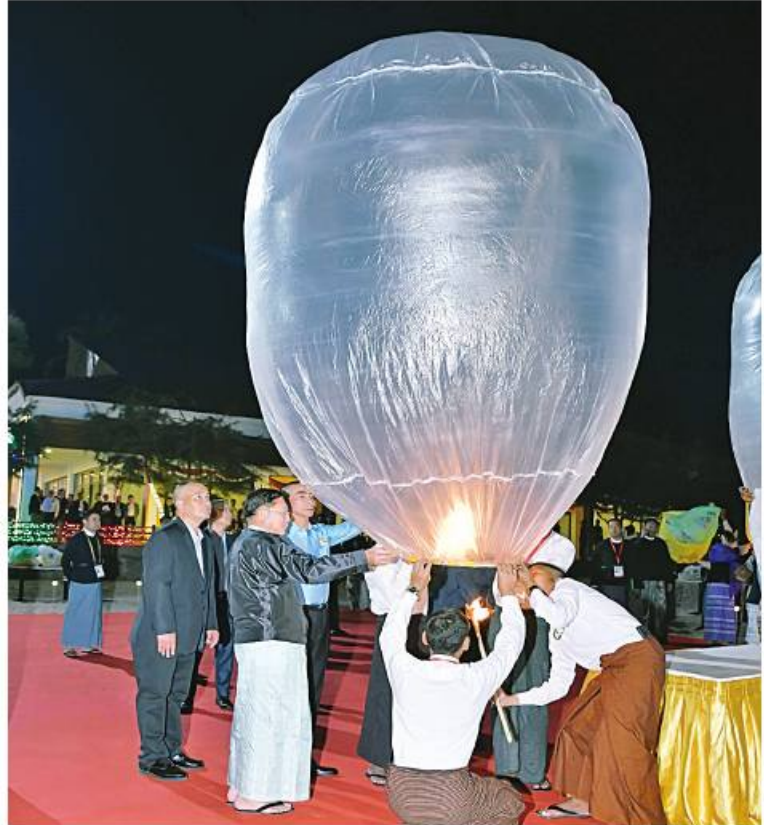
နိုင်ငံတော်စီမံအုပ်ချုပ်ရေးကောင်စီဥက္ကဋ္ဌ တပ်မတော်ကာကွယ်ရေးဦးစီးချုပ် ဝိုင်းချုပ်မှူးကြီးမင်းအောင်လှိုင်နှင့် ဇနီး ဒေါ်ကြူကြူလှ၊ ထိုင်းဘုရင့်တပ်မတော်ကာကွယ် ရေးဦးစီးချုပ် General Chalermphon Srisawasdi နှင့် ဇနီး Madame Budsakorn Srisawasdi ဦးဆောင်သည့်ကိုယ်စားလှယ်အဖွဲ့တို့က (၈)ကြိမ်မြောက် မြန်မာ-ထိုင်း တပ်မတော်နှစ်ရပ်အကြား အဆင့်မြင့်အရာရှိကြီးများအစည်းအဝေး အောင်မြင်ခြင်းအထိမ်းအမှတ်အဖြစ် မီးပုံးပျံများကို အတူတကွလွှတ်တင်ကြခဲ့။