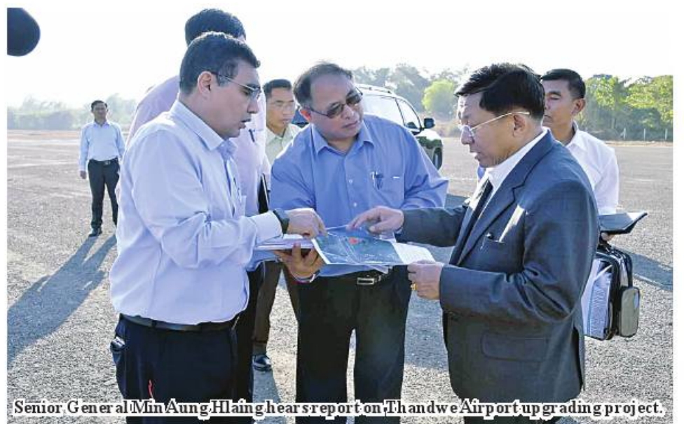
Senior General Min Aung Hlaing hears report on Thandwe Airport upgrading project.

The Senior General said the upgrading of Thandwe Airport to an international one will attract more travellers and facilitate transport of goods including marine products locally and internationally, thereby contributing