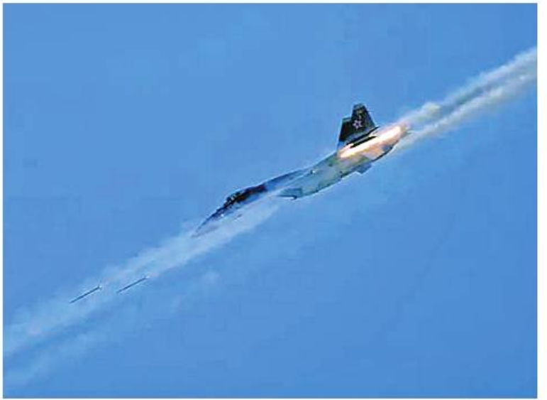
များကို လက်မှတ်ရေးထိုးခဲ့ကြကြောင်း သိရသည်။ Iran to get Russian Sukhoi Su-35 fighter jets, defense systems by March ကို ဘာသာပြန်ဆိုထားပါသည်။

မည့် Sukhoi Su-35 စတုတ္ထမျိုးဆက် တိုက်လေယာဉ် ၂၄ စင်းကို လက်ခံရရှိမည်ဖြစ်ကြောင်း၊ တိုက်လေယာဉ်တချို့သည် အီရန်နိုင်ငံအလယ်ပိုင်း Isfahan မြို့တွင် တည်ရှိသော အမှတ်(၈)နည်းဗျူဟာမြောက် လေတပ်စခန်းတွင် အခြေစိုက်မည်ဟု မီဒီယာများ၏အဆိုအရ ခန့်မှန်းထားကြောင်း သိရသည်။ အီရန်သည် ၁၉၉၀ ပြည့်လွန်နှစ်များအတွင်းကဝယ်ယူခဲ့သော ရုရှား MiG-29 Fulcrum တိုက်လေယာဉ်တချို့မှလွဲ၍ မကြာသေးမီနှစ်များအတွင်း မည်သည့်တိုက်ခိုက်ရေးလေယာဉ်သစ်မျှ မဝယ်ယူခဲ့ပေ။ အီရန်နှင့် ရုရှားတို့သည် ၎င်းတို့၏ စီးပွားရေး၊ ကုန်သွယ်ရေး၊ စွမ်းအင်နှင့် စစ်ရေး ပူးပေါင်းဆောင်ရွက်မှုကို အားကောင်းစေရန် မကြာသေးမီလများအတွင်း အရေးကြီးသောသဘောတူညီချက်