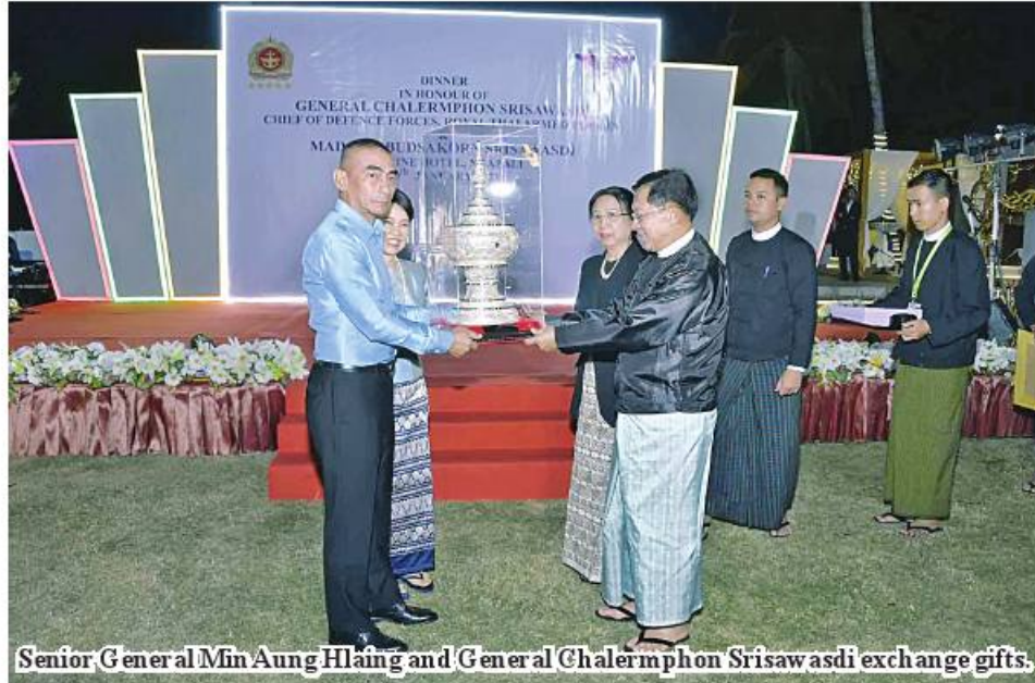
Senior General Min Aung Hlaing and General Chalermphon Srisawasdi exchange gifts.