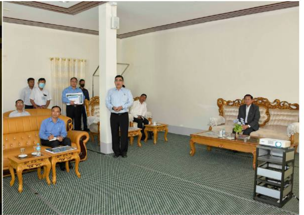
နိုင်ငံတော်စီမံအုပ်ချုပ်ရေးကောင်စီဥက္ကဋ္ဌ နိုင်ငံတော်ဝန်ကြီးချုပ် ဗိုလ်ချုပ်မှူးကြီးမင်းအောင်လှိုင်အား ပို့ဆောင်ရေးနှင့်ဆက်သွယ်ရေးဝန်ကြီးဌာန ဒုတိယဝန်ကြီး ဦးအောင်ကျော်ထွန်းက သံတွဲလေဆိပ်သမိုင်း အကျဉ်းနှင့် လေယာဉ်ကွင်းဆိုင်ရာအချက်အလက်များနှင့်စပ်လျဉ်း၍ ရှင်းလင်းတင်ပြစဉ်။

ကျောပုံးမှအဆက် ဝင်ရောက်လျက်ရှိမှု၊ ကိုဗစ်-၁၉ ရောဂါ ကာကွယ်ရေးလုပ်ငန်းများကို ထုတ်ပြန် ထားသည်စည်းမျဉ်း စည်းကမ်းများအတိုင်း စနစ်တကျလိုက်နာဆောင်ရွက်ရေးကြပ်မတ် ဆောင်ရွက်လျက်ရှိမှု၊ အပန်းဖြေကမ်းခြေ ခရီးစဉ်ဒေသများတိုးမြှင့်ဖော်ဆောင်လျက် ရှိမှု၊ ဟိုတယ်ဝန်ဆောင်မှုသင်တန်းများ ဖွင့်လှစ်လျက်ရှိမှု၊ ခရီးသွားလုပ်ငန်းများ ပိုမိုတိုးတက်စေရေး ဆောင်ရွက်လျက် ရှိမှု၊ ခရီးစဉ်ဒေသဆိုင်ရာ စီမံခန့်ခွဲမှု အဖွဲ့များ ဖွဲ့စည်းထားရှိမှု၊ Guest List Management System ဆောင်ရွက် လျက်ရှိမှုအခြေအနေများကို ရှင်းလင်း တင်ပြသည်။