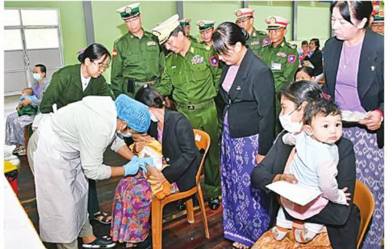
အလယ်ပိုင်းတိုင်းစစ်ဌာနချုပ် တိုင်းမှူး ဗိုလ်ချုပ်ကိုကိုဦး ကလေးငယ်များအား ပံ့ပိုးကာကွယ်ဆေး ထိုးနှံတိုက်ကျွေးနေမှုကို ကြည့်ရှုအားပေးခဲ့။

နေပြည်တော် ဇန်နဝါရီ ၂၀ အလယ်ပိုင်းတိုင်းစစ်ဌာနချုပ် ကွပ်ကဲ မှုအောက် တပ်ရင်း၊ တပ်ဖွဲ့များမှ တပ်မတော်သားမိသားစုဝင် မွေးကင်းစမှ တစ်နှစ်ခြောက်လထိ ကလေးငယ်များအား ပံ့ပိုးကာကွယ်ဆေး ထိုးနှံတိုက်ကျွေးခြင်းကို ယနေ့နံနက်ပိုင်းတွင် တိုင်းစစ်ဌာနချုပ် အားကစားခန်းမ၌ပြုလုပ်ရာ နယ်မြေခံ ဆေးတပ်ရင်းမှ ပါရဂူများ၊ ဆေးမှူးများနှင့် သူနာပြုများက တပ်ရင်း၊ တပ်ဖွဲ့များရှိ ကလေးငယ် ၁၅၇ ဦးတို့ကို ဆုံဆို့ ကြက်