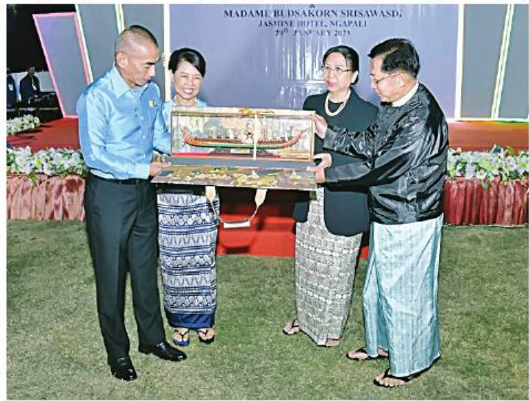
နိုင်ငံတော်စီမံအုပ်ချုပ်ရေးကောင်စီဥက္ကဋ္ဌ တပ်မတော်ကာကွယ်ရေးဦးစီးချုပ် ဝိုင်းချုပ်မှူးကြီးမင်းအောင်လှိုင်နှင့် ဇနီး ဒေါ်ကြူကြူလှတို့ အမှတ်တရလက်ဆောင်ပစ္စည်းများ အပြန်အလှန်ပေးအပ်ကြခဲ့။

ကာကွယ်ရေးဦးစီးချုပ်နှင့် ဇနီးတို့သည် (၈)ကြိမ်မြောက် မြန်မာ-ထိုင်းတပ်မတော် နှစ်ရပ်အကြား အဆင့်မြင့်အရာရှိကြီးများ အစည်းအဝေး အောင်မြင်ခြင်းအထိမ်းအမှတ်အဖြစ် မီးပုံးပျံများကို တက်ရောက် လာကြသည့် နှစ်ဖက်တပ်မတော်အရာရှိကြီး များနှင့်အတူ အတူတကွလွှတ်တင်ကြသည်။ ၎င်းနောက် နိုင်ငံတော်စီမံအုပ်ချုပ်ရေး ကောင်စီဥက္ကဋ္ဌ တပ်မတော်ကာကွယ်ရေး ဦးစီးချုပ်နှင့် ဇနီး၊ ထိုင်းဘုရင့်တပ်မတော် ကာကွယ်ရေးဦးစီးချုပ်နှင့် ဇနီးတို့သည် တက်ရောက်လာကြသူများနှင့်အတူ ဂုဏ်ပြု ညစာကို အတူတကွသုံးဆောင်ကြသည်။ အဆိုပါဂုဏ်ပြုညစာစားပွဲအခမ်းအနား သို့ နိုင်ငံတော်စီမံအုပ်ချုပ်ရေးကောင်စီ ဥက္ကဋ္ဌ တပ်မတော်ကာကွယ်ရေးဦးစီးချုပ် နှင့် ဇနီး၊ ထိုင်းဘုရင့်တပ်မတော်ကာကွယ် ရေးဦးစီးချုပ်နှင့် ဇနီးတို့နှင့်အတူ ညှော်ခင်း ကွပ်ကဲရေးမှူး (ကြည်း၊ ရေ၊ လေ) ဝိုင်းချုပ်ကြီးမောင်မောင်အေးနှင့် ဇနီး၊ ကာကွယ်ရေးဦးစီးချုပ်(ရေ) ဝိုင်းချုပ်ကြီး မိုးအောင်နှင့် ဇနီး၊