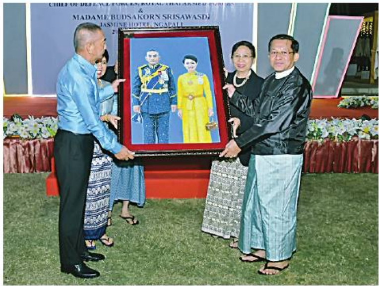
နိုင်ငံတော်စီမံအုပ်ချုပ်ရေးကောင်စီဥက္ကဋ္ဌ တပ်မတော်ကာကွယ်ရေးဦးစီးချုပ် ဝိုင်းချုပ်မှူးကြီးမင်းအောင်လှိုင်နှင့် ဇနီး ဒေါ်ကြူကြူလှတို့ အမှတ်တရလက်ဆောင်ပစ္စည်းများ အပြန်အလှန်ပေးအပ်ကြခဲ့။