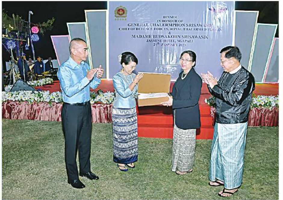
နိုင်ငံတော်စီမံအုပ်ချုပ်ရေးကောင်စီဥက္ကဋ္ဌ တပ်မတော်ကာကွယ်ရေးဦးစီးချုပ် ဗိုလ်ချုပ်မှူးကြီးမင်းအောင်လှိုင်နှင့်ဇနီး ဒေါ်ကြူကြူလှ၊ ထိုင်းဘုရင့်တပ်မတော်ကာကွယ်ရေးဦးစီးချုပ် General Chalermpthon Srisawasdi နှင့် ဇနီး Madame Budsakorn Srisawasdi တို့ အမှတ်တရလက်ဆောင်ပစ္စည်းများ အပြန်အလှန်ပေးအပ်ကြစဉ်။