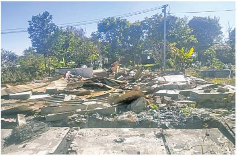
မီးရှို့ဖျက်ဆီးခြင်းခံထားရသည့် ကန်ပက်လက်မြို့နယ်ဦးစီးရုံးရုံး၏ မုတ်တမ်းဓာတ်ပုံ။