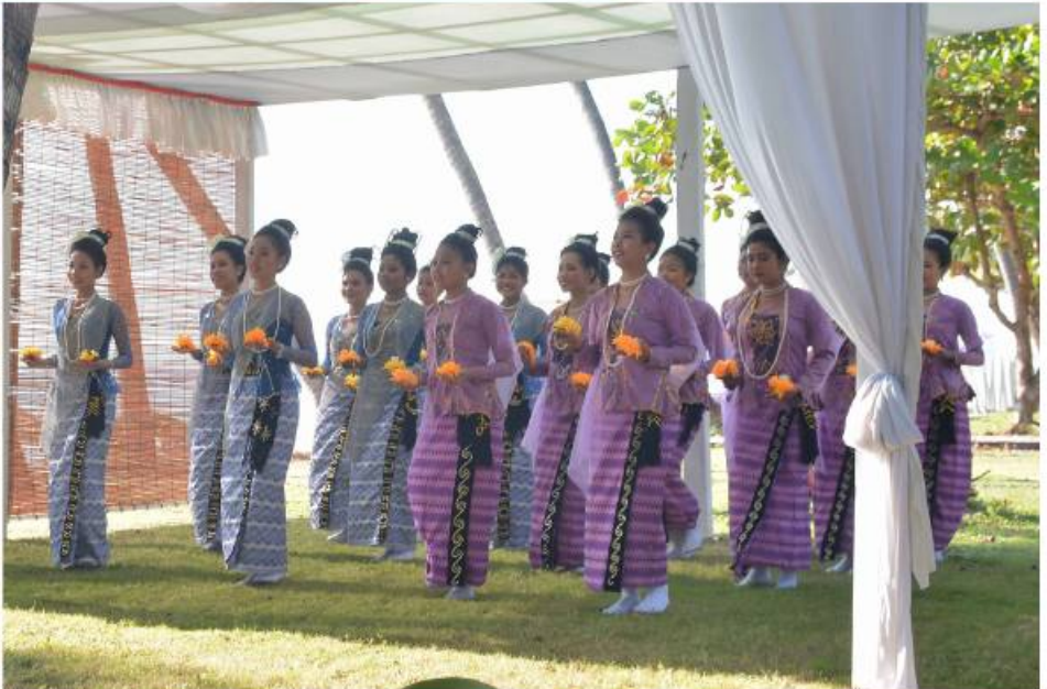
နိုင်ငံတော်စီမံအုပ်ချုပ်ရေးကောင်စီဥက္ကဋ္ဌ တပ်မတော်ကာကွယ်ရေးဦးစီးချုပ် ဗိုလ်ချုပ်မှူးကြီးမင်းအောင်လှိုင်၏ဇနီး ဒေါ်ကြူကြူလှနှင့် ထိုင်းဘုရင့်တပ်မတော်ကာကွယ်ရေးဦးစီးချုပ် General Chalermphon Srisawasdi ၏ဇနီး Madame Budsakorn Srisawasdi တို့က Amazing Ngapali Resort မှ ဖျော်ဖြေသည့် ရခိုင်ရိုးရာသီချင်းအကအလှများကို ကြည့်ရှုအားပေးစဉ်။

ကြိုဆိုနှုတ်ဆက်ကြသည်။ ထို့နောက် စေတီများက လက်ခံရယူကြသည်။ ဆက်လက်၍ နှင့်အဖွဲ့သည် နိုင်ငံတော်စီမံအုပ်ချုပ်ရေးရက်ကန်းနှင့် ရိုးရာလက်မှုပစ္စည်းများကို ယင်းနောက် ရိုးရာအကအဖွဲ့ကို ဂုဏ်ပြုတော်မြတ်ကိုဆီမီး၊ ပန်း၊ ရေချမ်း၊ သစ်သီးရွှေအန်တော်စေတီသို့ သွားရောက်ဖူးမြော်ကောင်စီဥက္ကဋ္ဌ တပ်မတော်ကာကွယ်ရေးဦးစီးချုပ်၏ဇနီး၊ တပ်မတော်အရာရှိကြီးများ၏ဇနီးများနှင့်အတူ Amazing Ngapali Resort မှ သွားရောက်ကာ ရခိုင်ရိုးရာပေးအပ်လှူဒါန်းရာ ဂေါပကအဖွဲ့ဝင်များက လက်ခံရယူကြသည်။ ထို့နောက် မွန်းလွဲပိုင်းတွင် ထိုင်းဘုရင့်တပ်မတော်ကာကွယ်ရေးဦးစီးချုပ်၏ဇနီးများက ရက်ကန်းနှင့် ရိုးရာလက်မှုပစ္စည်းများကို ယင်းနောက် ရိုးရာအကအဖွဲ့ကို ဂုဏ်ပြုချီးမြှင့်ငွေများပေးအပ်ကာ အမှတ်တရစုပေါင်းဓာတ်ပုံရိုက်ခဲ့ကြောင်း သတင်းရရှိသည်။