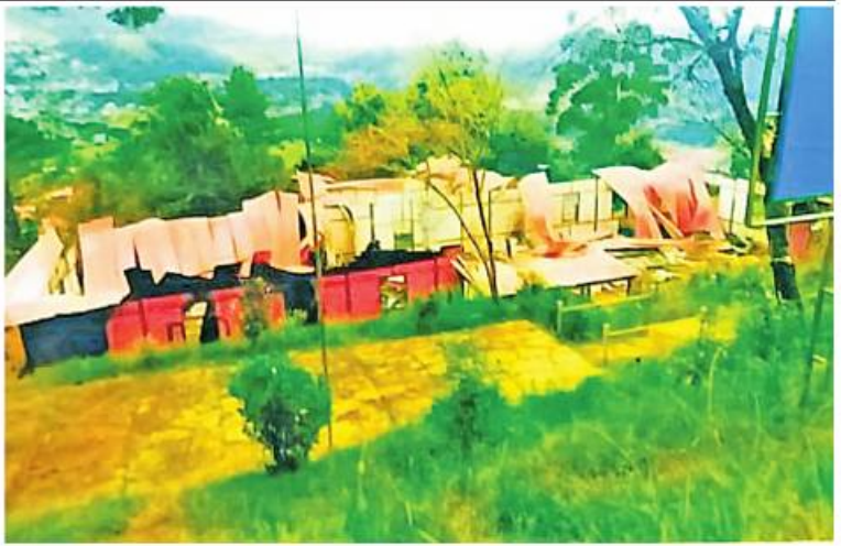
မီးလောင်ပုံဖြင့် ပစ်ပေါက်မီးရှို့ဖျက်ဆီးခြင်းခံရသည့် ရင်းပြည်နယ်ဦးစီးရုံးရုံး အဆောက်အအုံ၏ မုတ်တမ်းဓာတ်ပုံ။