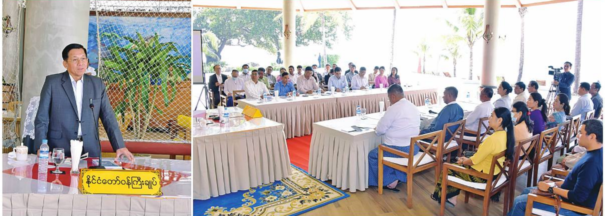
နိုင်ငံတော်စီမံအုပ်ချုပ်ရေးကောင်စီဥက္ကဋ္ဌ နိုင်ငံတော်ဝန်ကြီးချုပ် ဗိုလ်ချုပ်မှူးကြီးမင်းအောင်လှိုင် ရခိုင်ပြည်နယ် သံတွဲမြို့နယ်အတွင်းရှိ ဟိုတယ်နှင့်ခရီးသွားလုပ်ငန်းရှင်များအား တွေ့ဆုံ၍ ခရီးသွားလုပ်ငန်း ဖွံ့ဖြိုးတိုးတက်ရေးနှင့် ဒေသဖွံ့ဖြိုးတိုးတက်ရေးဆိုင်ရာများကို ဆွေးနွေးစဉ်။

နေပြည်တော် ၈နိုဝင်ဘာ ၂၀၂၂ - နိုင်ငံတော်စီမံအုပ်ချုပ်ရေးကောင်စီ ဥက္ကဋ္ဌ နိုင်ငံတော်ဝန်ကြီးချုပ် ဗိုလ်ချုပ်မှူးကြီးမင်းအောင်လှိုင် သည် ယနေ့မုန်းလွဲပိုင်းတွင် ရခိုင်ပြည်နယ် သံတွဲ မြို့နယ်အတွင်းရှိ ဟိုတယ်နှင့် ခရီးသွားလုပ်ငန်း ရှင်များကို သံတွဲမြို့ရှိ Pristine Mermaid Resort ဧည့်ခန်းမဆောင်၌ တွေ့ဆုံ၍ ခရီးသွားလုပ်ငန်း ဖွံ့ဖြိုးတိုးတက်ရေးနှင့် ဒေသဖွံ့ဖြိုးတိုးတက်ရေး ဆိုင်ရာများကို ဆွေးနွေးသည်။ အဆိုပါတွေ့ဆုံပွဲသို့ နိုင်ငံတော်စီမံအုပ်ချုပ်ရေး ကောင်စီဥက္ကဋ္ဌ နိုင်ငံတော်ဝန်ကြီးချုပ်နှင့်အတူ ကာကွယ်ရေးဦးစီးချုပ်ရုံးမှ တပ်မတော်အရာရှိကြီး များ၊ ပို့ဆောင်ရေးနှင့် ဆက်သွယ်ရေးဝန်ကြီးဌာန ဒုတိယဝန်ကြီး ဦးအောင်ကျော်ထွန်း၊ ရခိုင်ပြည် နယ် ဟိုတယ်နှင့် ခရီးသွားလာရေးညွှန်ကြားမှု ဦးစီးဌာန ဦးစီးမှူး ဦးတင်ထွန်းအောင်၊ ခရိုင်နှင့် မြို့နယ်အဆင့် ဌာနဆိုင်ရာတာဝန်ရှိသူများနှင့် သံတွဲမြို့နယ်အတွင်းရှိ ဟိုတယ်နှင့် ခရီးသွားလာ ရေးလုပ်ငန်းရှင်များ တက်ရောက်ကြသည်။ ဟိုတယ်နှင့် ခရီးသွားလာရေးလုပ်ငန်းများ ဆောင်ရွက်လျက်ရှိမှုနှင့် လိုအပ်ချက်များကို အသီးသီးဆွေးနွေးတင်ပြ ဦးစွာ ရခိုင်ပြည်နယ် ဟိုတယ်နှင့် ခရီးသွား လာရေးညွှန်ကြားမှုဦးစီးဌာန ဦးစီးမှူး ဦးတင် ထွန်းအောင်နှင့် သံတွဲခရိုင်ခရီးစဉ်ဒေသဆိုင်ရာ စီမံခန့်ခွဲရေးအဖွဲ့ဥက္ကဋ္ဌ ခရိုင်အုပ်ချုပ်ရေးမှူး ဦးမျိုးချစ်တို့က ရခိုင်ပြည်နယ်အတွင်းနှင့် သံတွဲ ခရိုင်အတွင်းရှိ ဟိုတယ်နှင့် တည်းခိုခိုပိတ်သာများ၏ လုပ်ငန်းဆောင်ရွက်နေမှုနှင့် သတ်မှတ်စည်းမျဉ်း စည်းကမ်းများနှင့်အညီ လုပ်ငန်းလိုင်စင်များ ထုတ်ပေးထားရှိမှု၊ ပြည်တွင်းပြည်ပခရီးသည်များ