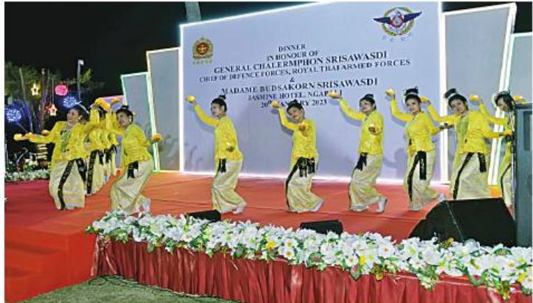
ပြည်သူ့ဆက်ဆံရေးနှင့်စိတ်ဓာတ်စစ်ဆင်ရေးညွှန်ကြားရေးမှူးရုံး ကွပ်ကဲမှုအောက် မြဝတီတေးဂီတအဖွဲ့မှ တေးသံရင်များ၊ အနုပညာဦးစီးဌာနနှင့် မြန်မာ့အသံနှင့်ရုပ်မြင် သံကြားတိုမှ အနုပညာရှင်များ၊ ပြင်ပအနုပညာရှင်များနှင့် ပြည်နယ်ယဉ်ကျေးမှုအဖွဲ့မှ အနုပညာရှင်များက တေးသံသာများဖြင့် သီဆိုတီးမှုတ်ကပြပျော်မြေကြစေခဲ့။