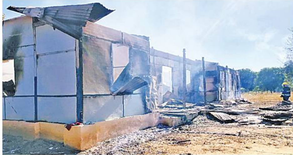
မီးရှို့ဖျက်ဆီးခြင်း ခံထားရသည့် မြောင်မြို့နယ် ဦးစီးရုံးရုံး အဆောက်အအုံ၏ မုတ်တမ်းဓာတ်ပုံ။