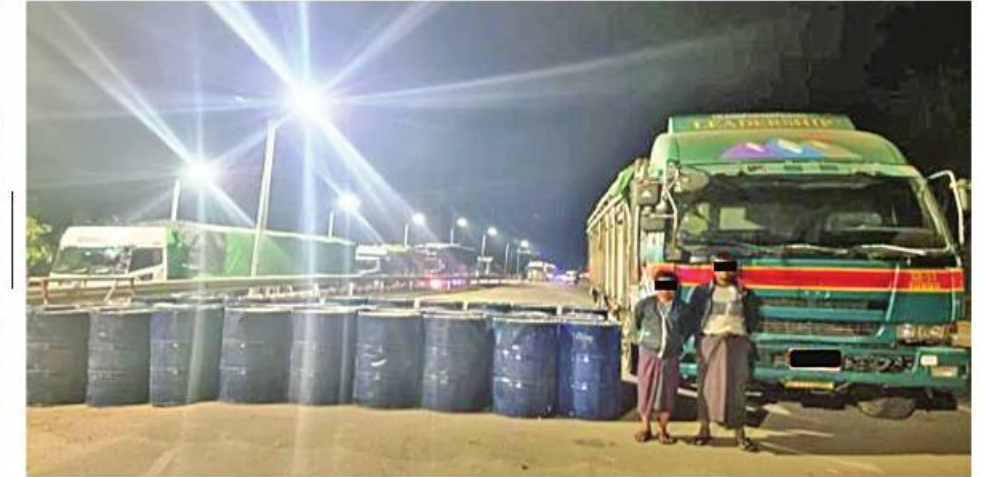
ရမ်းပြည်နယ်(တောင်ပိုင်း) လွိုင်လင်မြို့နယ်တွင် ဖမ်းဆီးရမိသည့် တရားခံများကို သိမ်းဆည်းရမိ ဓာတုပစ္စည်းများနှင့်အတူ တွေ့ရစဉ်။