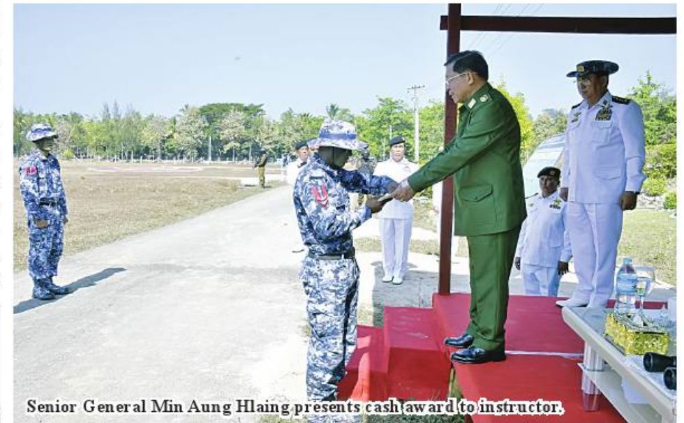
Senior General Min Aung Hlaing presents cash award to instructor.

and welfare for families, and manageable farming presented by the local commander.