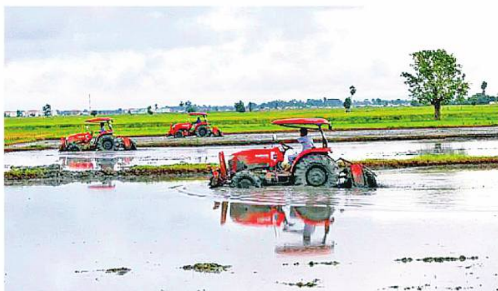
ခနဲဖြူမြို့နယ်တွင် ရွှေဝါးစိုက်ရန် လယ်ယာမြေ ဖြိုခင်းအုပ်စုကို တွေ့ရပုံစဉ်။