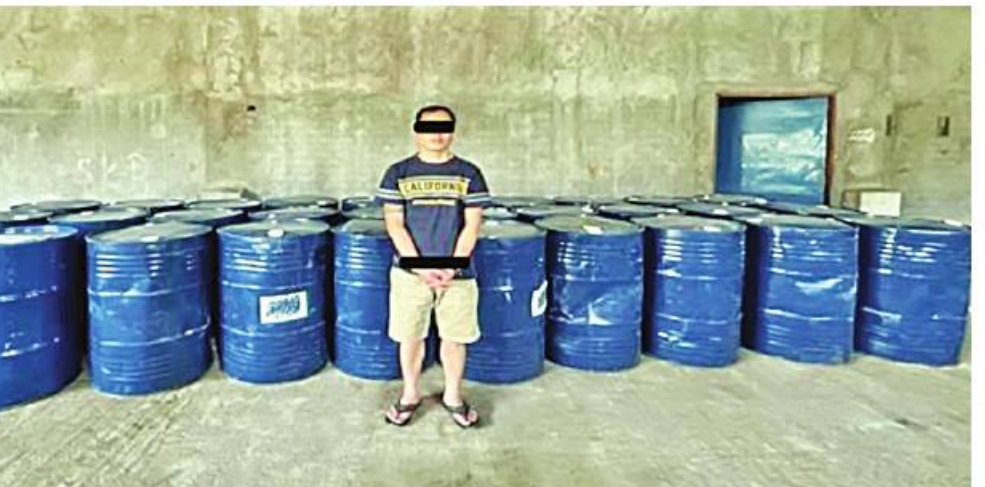
ရန်ကုန်တိုင်းဒေသကြီး အင်းစိန်မြို့နယ်တွင် ဖမ်းဆီးရမိတရားခံကို သိမ်းဆည်းရမိသည့် ထိန်းချုပ်ဓာတုပစ္စည်းများနှင့်အတူ တွေ့ရစဉ်။

နေပြည်တော် ဇန်နဝါရီ ၁၉ ရွှေကြိတ်ဒေသအတွင်းသို့ ဓာတုပစ္စည်းများ နည်းမျိုးစုံဖြင့်ဝင်ရောက်၍ မူးယစ်ဆေးဝါး ထုတ်လုပ်သယ်ဆောင် ရောင်းဝယ်မှုများမရှိစေရေးအတွက် မြန်မာ-လာအို-ထိုင်း သုံးနိုင်ငံပူးပေါင်း၍ တရားမဝင်သယ်ဆောင်ရောင်းဝယ်မှု၊ တရားဝင်သယ်ဆောင်ရောင်းဝယ်ခွင့်ရယူပြီး မူးယစ်ဆေးဝါးထုတ်လုပ်ရာ နယ်ပယ်များသို့ တရားမဝင်သယ်ဆောင်မှု ထိန်းချုပ်ရေးကို အရှိန်အဟုန်မြှင့် ဆောင်ရွက်လျက်ရှိရာ မူးယစ်ဆေးဝါး တားဆီးနှိမ်နင်းရေး ရဲတပ်ဖွဲ့မှ တပ်ဖွဲ့ဝင်များပါဝင်သော ပူးပေါင်းအဖွဲ့သည် ဇန်နဝါရီ ၁၄ ရက် နံနက် ၇ နာရီခွဲတွင် ရမ်းပြည်နယ် (တောင်ပိုင်း) တောင်ကြီးမြို့နယ် တောင်ကြီး-လွိုင်လင်သွားကားလမ်း ၄ မိုင် ပူးပေါင်းစစ်ဆေးရေးဂိတ်တွင် တောင်ကြီးမှ လွိုင်လင်ဘက်သို့ ဇော်ဌေးအောင် မောင်းနှင်ပြီး အာကာလိုက်ပါလာသည့် ၂၂ ဘီး တွဲယာဉ်ကို သတင်းအရချာဖွေရာ ယာဉ်ပေါ်တွင် အချို့ရည်ကတ်များဖြင့်ဖုံးအုပ်၍ တရားမဝင်သယ်ဆောင်လာသော သံပီပါ အလုံး ၈၀ ဖြင့်ထည့်လျက် ဓာတုပစ္စည်း Sulfurous Dichloride ၁၂ တန် သိမ်းဆည်းရမိခဲ့သည်။ သတင်းကွင်းဆက်အရ ဇန်နဝါရီ ၁၅ ရက် နံနက် ၉ နာရီခွဲတွင် အဆိုပါ