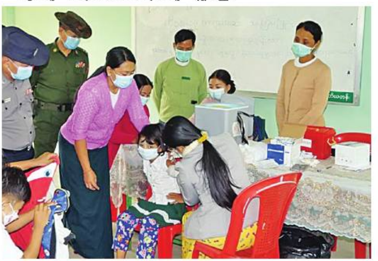
မန္တလေးတိုင်းဒေသကြီး အမရပူရမြို့နယ်အတွင်းရှိ ကျောင်းသား၊ ကျောင်းသူ များကို ကိုဗစ်-၁၉ ရောဂါ ကာကွယ်ဆေး ထိုးနှံပေးစဉ်။

များကိုလည်း ကိုဗစ်-၁၉ ရောဂါ ကာကွယ် ဆေးများထိုးနှံပေးလျက်ရှိရာ ယနေ့တွင် ရောဂါတိုင်းဒေသကြီးအတွင်းရှိ မြို့နယ် ၂၆ မြို့နယ်တို့၌ ကျောင်းသား၊ ကျောင်းသူ ဦးရေ ၁၈၂၀၀၊ စစ်ကိုင်းတိုင်းဒေသကြီး ခန္တီးမြို့၌ ကျောင်းသား၊ ကျောင်းသူ ၂၁၉ ဦးနှင့် မန္တလေးတိုင်းဒေသကြီးအတွင်းရှိ ခရိုင်ခုနစ်ခုတို့၌ ကျောင်းသား၊ ကျောင်းသူ ၆၂၄၉ ဦးတို့ကို တပ်မတော်မှဆေးအဖွဲ့ များက ပြည်သူဆေးရုံများမှ ဆရာဝန်များ၊ သက်ဆိုင်ရာ ကျန်းမာရေးဝန်ထမ်းများ၊ စေတနာ့ဝန်ထမ်းများနှင့် ပူးပေါင်း၍ ကိုဗစ်-၁၉ ရောဂါ ကာကွယ်ဆေးထိုးနှံ ပေးခြင်းများ ဆောင်ရွက်ပေးသည်။ ယင်းသို့ ဆောင်ရွက်ပေးနေမှုများကို သက်ဆိုင်ရာ တိုင်းစစ်ဌာနချုပ်များမှ တာဝန်ရှိသူများက သွားရောက်ကြည့်ရှု အားပေးပြီး လိုအပ်သည်များ ညှိနှိုင်း ဆောင်ရွက်ပေးခဲ့ကြောင်း သတင်း ရရှိသည်။