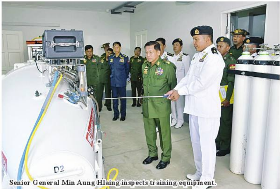
Senior General Min Aung Hlaing inspects training equipment.