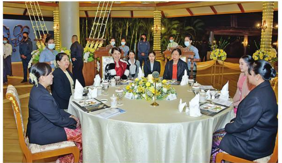
နိုင်ငံတော်စီမံအုပ်ချုပ်ရေးကောင်စီဥက္ကဋ္ဌ တပ်မတော်ကာကွယ်ရေးဦးစီးချုပ် ဗိုလ်ချုပ်မှူးကြီးမင်းအောင်လှိုင်နှင့်ဓနိုး ဒေါ်ကြူကြူလှ၊ ထိုင်းဘုရင့်တပ်မတော်ကာကွယ်ရေးဦးစီးချုပ် General Chalermphon Srisawasdi နှင့် ဓနိုးတို့က ပြည်သူ့ဆက်ဆံရေးနှင့်စိတ်ဓာတ်စစ်ဆင်ရေးညွှန်ကြားရေးမှူးရုံးကွပ်ကဲမှုအောက် မြဝတီတေးဂီတအဖွဲ့မှ တေးသံရှင်များနှင့် မြန်မာ့အသံနှင့် ရုပ်မြင်သံကြားမှ အနုပညာရှင်များ၏ တေးသံသာများဖြင့် သီဆိုတီးမှုတ်ကပြဖျော်ဖြေမှုကို ကြည့်ရှုအားပေးစဉ်။