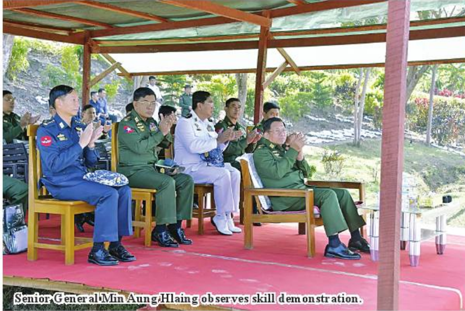
Senior General Min Aung Hlaing observes skill demonstration.