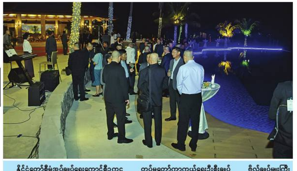
ထိုင်းဘုရင့်တပ်မတော်ကာကွယ်ရေးဦးစီးချုပ် General Chalermphon Srisawasdi နှင့်ဓနိုးတို့က သီဆိုကပြဖျော်ဖြေခဲ့ကြသည့် အနုပညာရှင်များအား ဂုဏ်ပြုချီးမြှင့်ငွေများပေးအပ်စဉ်။