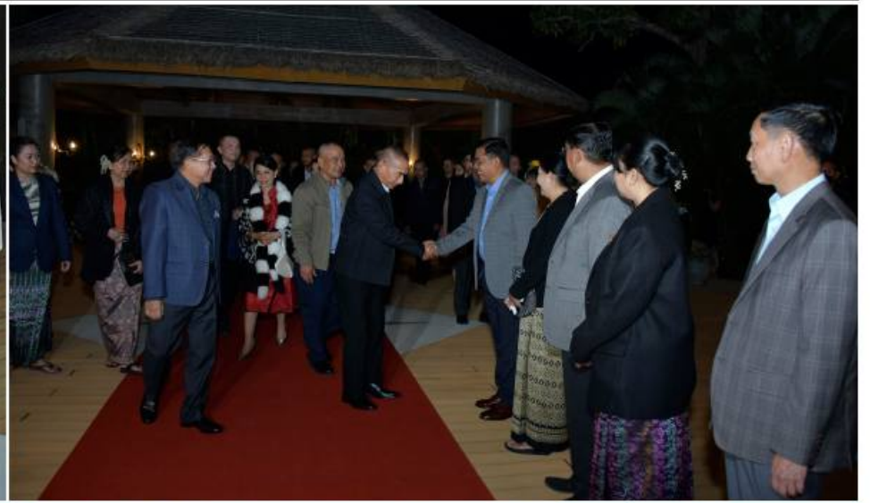
နိုင်ငံတော်စီမံအုပ်ချုပ်ရေးကောင်စီဥက္ကဋ္ဌ တပ်မတော်ကာကွယ်ရေးဦးစီးချုပ် ဗိုလ်ချုပ်မှူးကြီးမင်းအောင်လှိုင်၊ ဓနိုး ဒေါ်ကြူကြူလှနှင့်အဖွဲ့ဝင်များက ထိုင်းဘုရင့်တပ်မတော်ကာကွယ်ရေးဦးစီးချုပ် General Chalermphon Srisawasdi နှင့် ဓနိုးတို့အား ရင်းနှီးနှေးထွေးစွာ ကြိုဆိုနှုတ်ဆက်စဉ်။