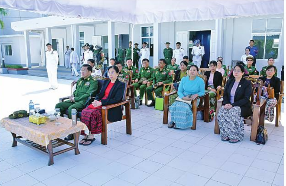
နိုင်ငံတော်စီမံအုပ်ချုပ်ရေးကောင်စီဥက္ကဋ္ဌ တပ်မတော်ကာကွယ်ရေးဦးစီးချုပ် ဗိုလ်ချုပ်မှူးကြီးမင်းအောင်လှိုင်၊ ဇနီး ဒေါ်ကြူကြူလှနှင့် အဖွဲ့ဝင်များက ရေတပ်ပင်မရေငုပ်နှင့် ဆယ်ယူရေးတပ်ရှိ Training Pool အတွင်း တပ်မတော်(ရေ)မှ တပ်ဖွဲ့ဝင်များ၏ ၅ မိတာအမြင့်မှ ရန်ချ၍ မိတာ ၅၀ ခြေတုပ်၊ လက်တုပ်ကူးခပ်လေ့ကျင့်နေမှုကို ကြည့်ရှုစဉ်။

နေပြည်တော် ဇန်နဝါရီ ၁၉ မင်းအောင်လှိုင်သည် ဇနီး ဒေါ်ကြူကြူလှ၊ ညိုနှိုင်း (ရေ) ဗိုလ်ချုပ်ကြီးမိုးအောင်နှင့် ဇနီး၊ ကာကွယ်ရေး များနှင့် ဇနီးများ၊ အနောက်ပိုင်းတိုင်းစစ်ဌာနချုပ် နိုင်ငံတော်စီမံအုပ်ချုပ်ရေးကောင်စီ ဥက္ကဋ္ဌ၊ ကွပ်ကဲရေးမှူး (ကြည်း၊ ရေ၊ လေ) ဗိုလ်ချုပ်ကြီး ဦးစီးချုပ်(လေ) ဗိုလ်ချုပ်ကြီးထွန်းအောင်နှင့် ဇနီး၊ တိုင်းမှူး ဗိုလ်ချုပ်ထင်လတ်ဦးနှင့် တာဝန်ရှိသူများ တပ်မတော်ကာကွယ်ရေးဦးစီးချုပ် ဗိုလ်ချုပ်မှူးကြီး မောင်မောင်အေးနှင့် ဇနီး၊ ကာကွယ်ရေးဦးစီးချုပ် ကာကွယ်ရေးဦးစီးချုပ်မှူး တပ်မတော်အရာရှိကြီး လိုက်ပါ၍ စာမျက်နှာ ၁၆ ကော်လံ ၁ ☆