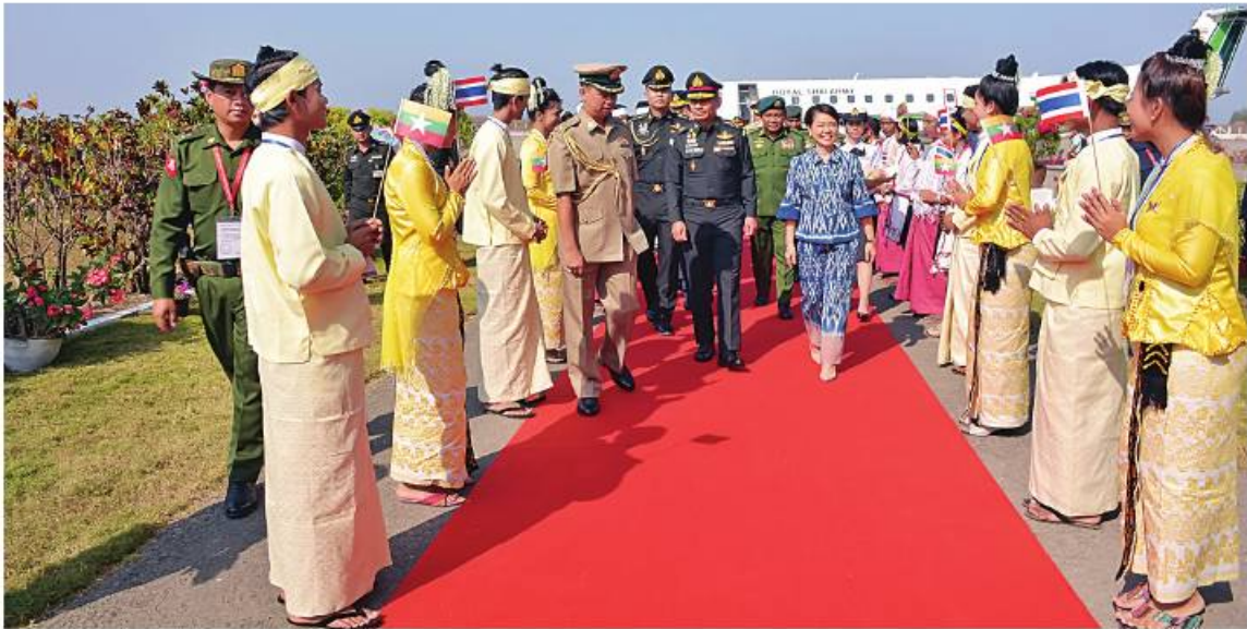
ထိုင်းဘုရင့်တပ်မတော်ကာကွယ်ရေးဦးစီးချုပ် General Chalermphon Srisawasdi ဦးဆောင်သည့် ထိုင်းဘုရင့်တပ်မတော် အဆင့်မြင့်ကိုယ်စားလှယ်အဖွဲ့အား ညီနောင်ကွဲကဲရေးမှူး (ကြည်း၊ ရေ၊ လေ) ဗိုလ်ချုပ်ကြီးမောင်မောင်အေးနှင့် တာဝန်ရှိသူများက လေဆိပ်တွင် ရင်းနှီးရေးထွေးစွာကြိုဆိုနှုတ်ဆက်စဉ်။

နေပြည်တော် ဇန်နဝါရီ ၁၉ မြန်မာနိုင်ငံ၌ အိမ်ရှင်အဖြစ် လက်ခံ ကျင်းပပြုလုပ်သည့် မြန်မာ-ထိုင်း တပ်မတော်နှစ်ရပ်အကြား အဆင့်မြင့် အရာရှိကြီးများအစည်းအဝေး (8 th High Level Committee Meeting) သို့ တက်ရောက်ရန်အတွက် ထိုင်းဘုရင့်တပ်မတော် ကာကွယ်ရေးဦးစီးချုပ် General Chalermphon Srisawasdi ဦးဆောင်သည့် ထိုင်းဘုရင့်တပ်မတော်အဆင့်မြင့် ကိုယ်စားလှယ်အဖွဲ့သည် ယနေ့နံနက်ပိုင်းတွင် ထိုင်းဘုရင့်တပ်မတော် အထူးလေယာဉ်ဖြင့် ရခိုင်ပြည်နယ် သံတွဲလေဆိပ်သို့ ရောက်ရှိကြသည်။ အဆိုပါ ထိုင်းဘုရင့်တပ်မတော် ကာကွယ်ရေးဦးစီးချုပ် ဦးဆောင်သည့် ထိုင်းဘုရင့်တပ်မတော် အဆင့်မြင့်ကိုယ်စားလှယ်အဖွဲ့ကို ညီနောင်ကွဲကဲရေးမှူး (ကြည်း၊ ရေ၊ လေ) ဗိုလ်ချုပ်ကြီးမောင်မောင်အေးနှင့် တာဝန်ရှိသူများက လေဆိပ်တွင် ရင်းနှီးရေးထွေးစွာကြိုဆိုနှုတ်ဆက်စဉ်။