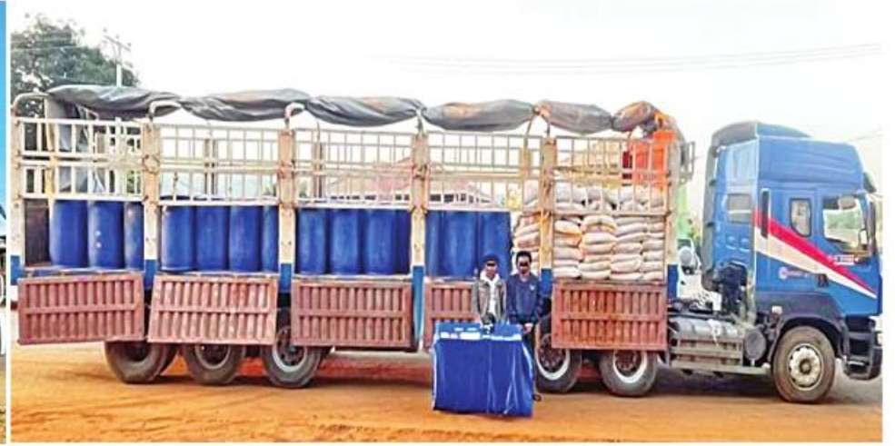
ရမ်းပြည်နယ်(တောင်ပိုင်း) တောင်ကြီးမြို့ ၄ မိုင်ခန့်ဆေးရေးဂိတ်တွင် ဖမ်းဆီးရမိသည့် တရားခံများကို သိမ်းဆည်းရမိ ဓာတုပစ္စည်းများနှင့်အတူ တွေ့ရစဉ်။