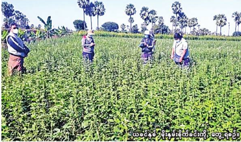
ယခင်နှစ် မိုးနှမ်းစိုက်ခင်းကို တွေ့ရစဉ်။