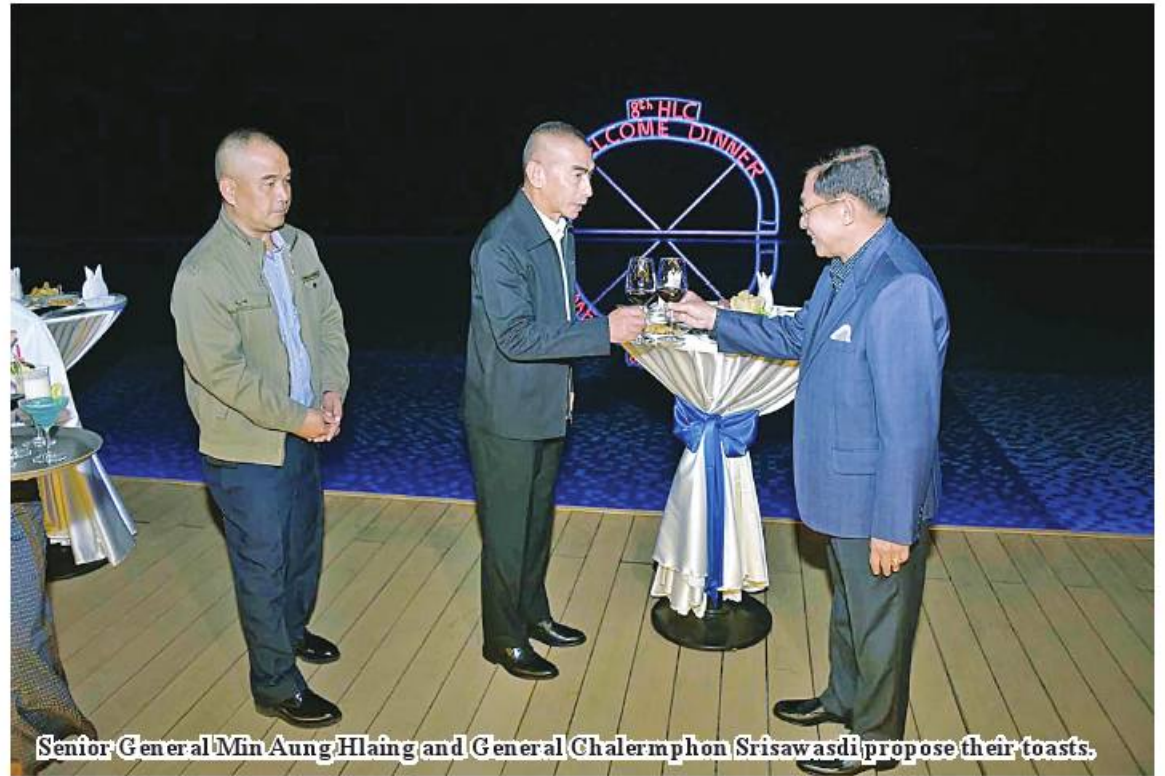
Senior General Min Aung Hlaing and General Chalermphon Srisawasdi propose their toasts.