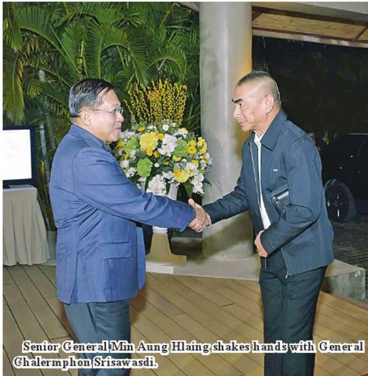
Senior General Min Aung Hlaing shakes hands with General Chalermphon Srisawasdi.