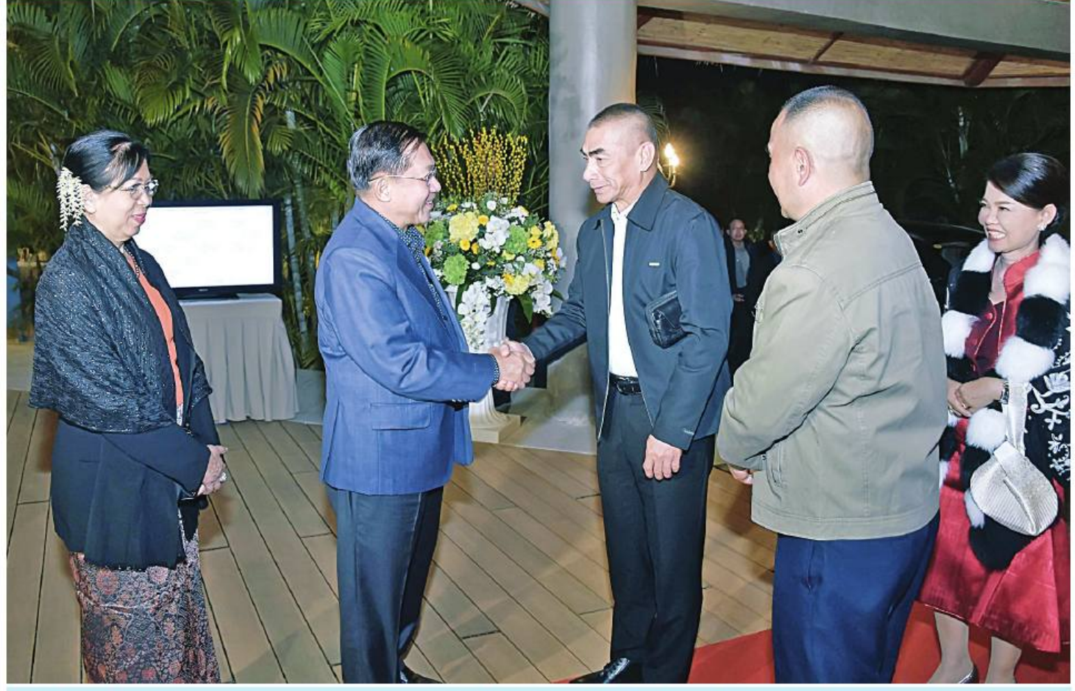
နိုင်ငံတော်စီမံအုပ်ချုပ်ရေးကောင်စီဥက္ကဋ္ဌ တပ်မတော်ကာကွယ်ရေးဦးစီးချုပ် ပိုလ်ချုပ်မှူးကြီးမင်းအောင်လှိုင်နှင့် ဇနီး ဒေါ်ကြူကြူလှ ထိုင်းဘုရင့်တပ်မတော်ကာကွယ်ရေးဦးစီးချုပ် General Chalemphon Srisawasdi နှင့် ဇနီးတို့ကို ရင်းနှီးငွေထွေးစွာကြိုဆိုနှုတ်ဆက်စဉ်။

နေပြည်တော် ဇန်နဝါရီ ၁၉ နိုင်ငံတော်စီမံအုပ်ချုပ်ရေးကောင်စီ ဥက္ကဋ္ဌ တပ်မတော်ကာကွယ်ရေးဦးစီးချုပ် ပိုလ်ချုပ်မှူးကြီး မင်းအောင်လှိုင်နှင့် ဇနီး ဒေါ်ကြူကြူလှတို့သည် မြန်မာနိုင်ငံ၌ အိမ်ရှင်အဖြစ် လက်ခံကျင်းပ ပြုလုပ်သည့် မြန်မာ-ထိုင်း တပ်မတော်နှစ်ရပ်အကြား အဆင့်မြင့်အရာရှိကြီးများအစည်းအဝေး (8 th High Level Committee Meeting) သို့ တက်ရောက်ရန် ရောက်ရှိနေသည့် ထိုင်းဘုရင့်တပ်မတော်ကာကွယ်ရေးဦးစီးချုပ် General Chalemphon Srisawasdi နှင့် ဇနီး ဦးဆောင်သည့်ကိုယ်စားလှယ်အဖွဲ့ဝင်များကို ယနေ့ညပိုင်းတွင် ရခိုင်ပြည်နယ် သံတွဲမြို့ ငပလီကမ်းခြေ Pristine Mermaid Resort ၌ ညစာစားပွဲဖြင့် ကြိုဆိုညှော်ခံသည်။ အဆိုပါ ညစာစားပွဲအခမ်းအနားသို့ နိုင်ငံတော်စီမံအုပ်ချုပ်ရေးကောင်စီ ဥက္ကဋ္ဌ တပ်မတော်ကာကွယ်ရေးဦးစီးချုပ်နှင့် ဇနီး၊ ထိုင်းဘုရင့်တပ်မတော်ကာကွယ်ရေးဦးစီးချုပ်နှင့် ဇနီးတို့နှင့်အတူ ညှော်ခင်းကွပ်ကဲရေးမှူးကြီး(ကြည်း၊ ရေ၊ လေ) ပိုလ်ချုပ်ကြီးမောင်မောင်အေးနှင့် ဇနီး၊ စာမျက်နှာ ၁၈ ကော်လံ ၄ ဖြ