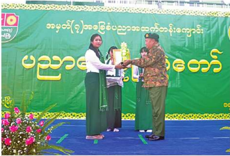
အရှေ့ပိုင်းတိုင်းစစ်ဌာနချုပ်မှ တာဝန်ရှိသူတစ်ဦးက ထူးချွန်ဆုရကျောင်းသူတစ်ဦးကို ဆုပေးအပ်ချီးမြှင့်စဉ်။

များ၊ ဆရာ၊ဆရာမများ၊ ကျောင်းသားမိဘ များ၊ ကျောင်းသား၊ ကျောင်းသူများနှင့် ဒေသခံတိုင်းရင်းသားများ တက်ရောက် ကြသည်။ ဦးစွာ တိုင်းမှူးနှင့် တာဝန်ရှိသူများက သက်ဆိုင်ရာကျောင်းများ၏ ၂၀၂၂- ၂၀၂၃ ပညာသင်နှစ် ပညာရေးစုံညီပွဲတော် နှင့် ပညာရည်ချွန်ဆုပေးပွဲအခမ်းအနားများ ကို ဖွဲ့စည်းပြုစုဖွင့်လှစ်ပေးပြီး ကျောင်းသား၊ ကျောင်းသူများ၏ သရုပ်ဖော်ကပြဖော်ပြ