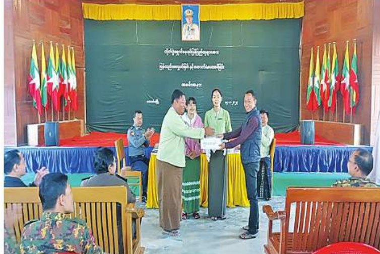
ချင်းပြည်နယ် ပလက်ဝမြို့နယ်နှင့် ဆမီးမြို့နယ်တို့မှ နေရပ်ပြန်ကြမည့် ယာယီနေရပ်စွန့်ခွာသူ အိမ်ထောင်စုဝင်များကို တာဝန်ရှိသူတစ်ဦးက ထောက်ပံ့ငွေများပေးအပ်ခြင်း