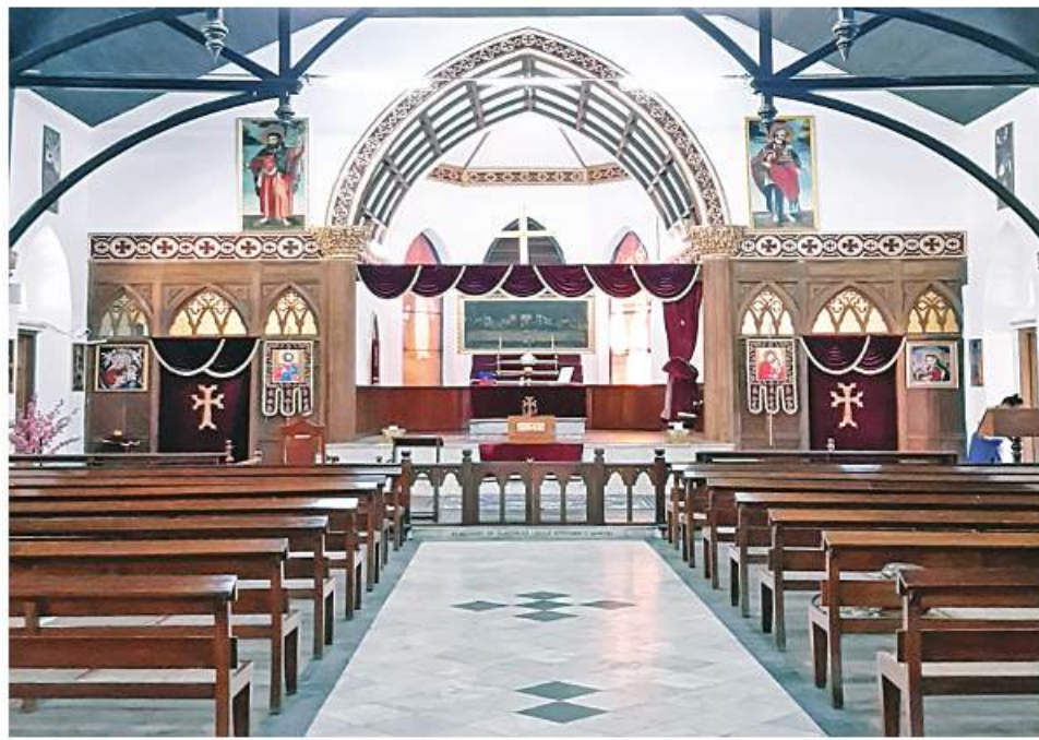
အာမေးနီးယားဘုရားကျောင်းအတွင်းပိုင်းကို တွေ့ရစဉ်။

အာမေးနီးယားနိုင်ငံသည် ကော့ကေးဆပ်နှင့် ယူရေးရှားဒေသမှ တောတောင်ထူထပ်သော ကုန်းတွင်းပိတ်နိုင်ငံတစ်နိုင်ငံဖြစ်ကာ ယခင်က ဆိုဗီယက်ယူနီယံ၏ ပြည်နယ်တစ်ခုဖြစ်ခဲ့ပြီး ၁၉၉၀ ပြည့်နှစ် ဩဂုတ်၂၃ ရက်တွင် ဆိုဗီယက်ယူနီယံမှ ခွဲထွက်၍ အာမေးနီးယားသမ္မတနိုင်ငံကို ထူထောင်ခဲ့သည်။