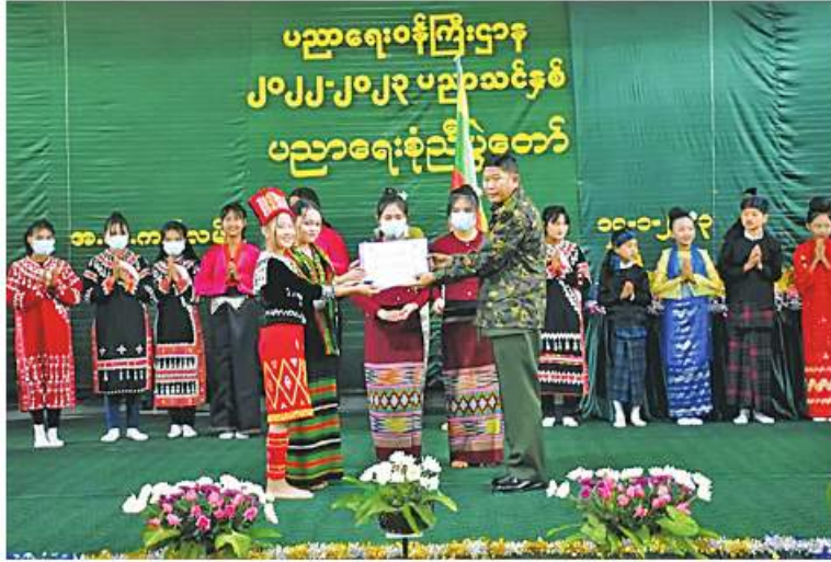
အရှေ့အလယ်ပိုင်းတိုင်းစစ်ဌာနချုပ် တိုင်းမှူး ဝိုင်းမျိုး၊ ဝိုင်းမျိုးမင်းထွန်း၊ ကျောင်းသား၊ ကျောင်းသူများကို ဂုဏ်ပြုချီးမြှင့်ပေးပေးအပ်စဉ်။

နေပြည်တော် ဇန်နဝါရီ ၁၇ ရှမ်းပြည်နယ်(တောင်ပိုင်း) နယ်စပ် မြို့နယ်နှင့် ဒိုလမ်မြို့နယ်တို့ရှိ အခြေခံ ပညာကျောင်းများ၏ ၂၀၂၂-၂၀၂၃ ပညာ သင်နှစ် ပညာရေးစုံညီပွဲတော်နှင့်ပညာရည် ချွန်ဆုပေးပွဲကို ဇန်နဝါရီ ၁၆ ရက်နှင့် ၁၇ ရက်တို့တွင် သက်ဆိုင်ရာကျောင်းများ၌ အသီးသီးပြုလုပ်ရာ အရှေ့အလယ်ပိုင်းတိုင်း စစ်ဌာနချုပ် တိုင်းမှူး ဝိုင်းမျိုးမင်းထွန်း နှင့် အဖွဲ့ဝင်များ၊ ဌာနဆိုင်ရာတာဝန်ရှိသူ