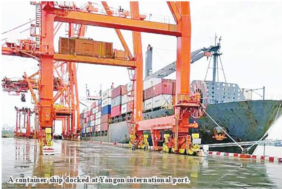
A container ship docked at Yangon international port.

Yangon January 17 Yangon International Ports Authority stated that a total of 52 container ships from 16 international commercial shipping lines will dock at Myanmar Port Authority in January 2023. As Myanmar trades with customer countries in shipping accounting for 95 per cent, container ships from international commercial shipping lines dock at international ports of Yangon on a monthly basis. The Ministry of Commerce, the Myanmar Port