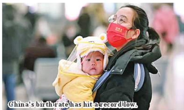
China's birth rate has hit a record low.

Beijing January 17 China's population has fallen for the first time in 60 years, with the national birth rate hitting a record low - 6.77 births per 1,000 people. The population in 2022 - 1.4118 billion - fell by 850,000 from 2021. China's birth rate has been declining for years, prompting a slew of policies to try to slow the trend. But seven years after scrapping the one-child policy, it has entered what one official described as an "era of negative population growth". The birth rate in 2022 was also down from 7.52 in 2021, according to China's National Bureau of Statistics, which released the figures on Tuesday.