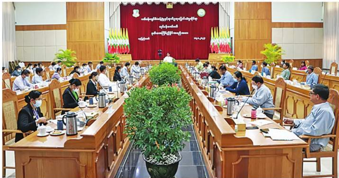
နေပြည်တော် ဇန်နဝါရီ ၁၇

ပတ်ဝန်းကျင်စီမံခန့်ခွဲမှုနှင့် ရာသီဥတုပြောင်းလဲမှုဆိုင်ရာ လုပ်ငန်းကော်မတီ ဒုတိယအကြိမ် ညှိနှိုင်းအစည်းအဝေးကို