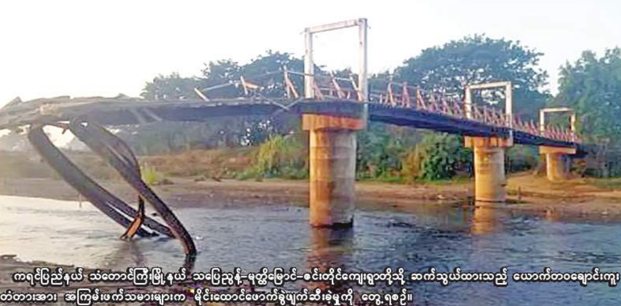
ကရင်ပြည်နယ် သံတောင်ကြီးမြို့နယ် သပြေညွန့်-မုတ္တိမြောင်-ဇင်းတိုင်ကျေးရွာတို့သို့ ဆက်သွယ်ထားသည့် ယောက်တဝချောင်းကူးတံတားအား အကြမ်းဖက်သမားများက မိုင်းထောင်ဖောက်ခွဲဖျက်ဆီးခဲ့မှုကို တွေ့ရစဉ်။