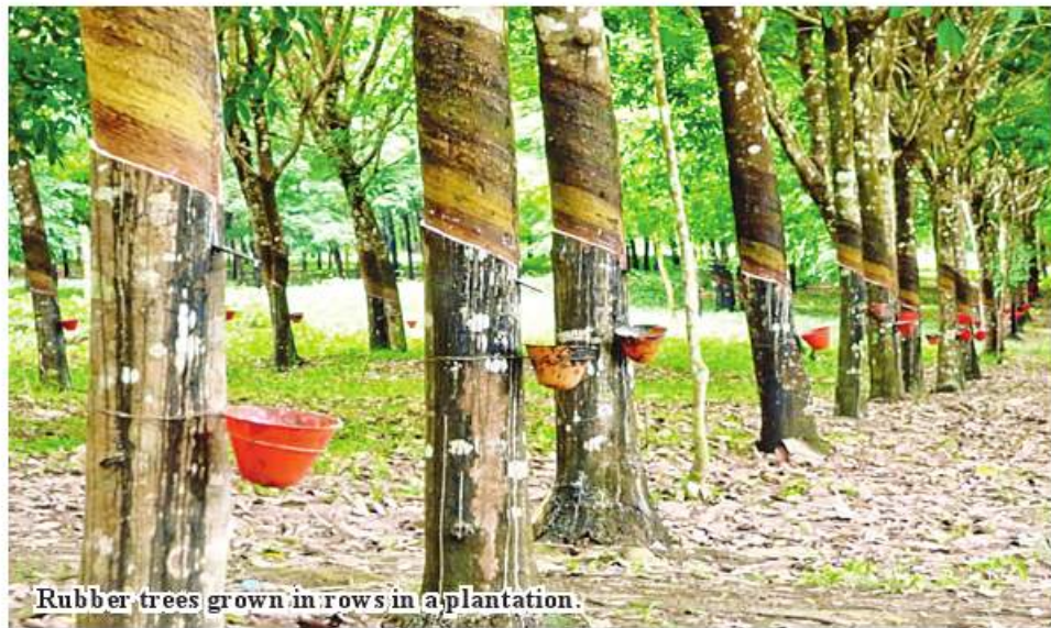
Rubber trees grown in rows in a plantation.

Kawthoung January 17 Rubber in Taninthayi Region gets good price in the domestic market, and local rubber farm owners earn increased income in exporting rubber to Thailand via Kawthoung, said U