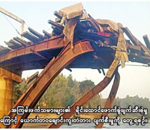
အကြမ်းဖက်သမားများ၏ မိုင်းထောင်ဖောက်ခွဲဖျက်ဆီးခဲ့မှုကြောင့် ယောက်တဝချောင်းကူးတံတား ပျက်စီးမှုကို တွေ့ရစဉ်။

နေပြည်တော် ဇန်နဝါရီ ၁၇ ကရင်ပြည်နယ် သံတောင်ကြီးမြို့နယ်၌ အကြမ်းဖက်သမားများက သပြေညွန့်-မုတ္တိမြောင်-ဇင်းတိုင်ကျေးရွာတို့သို့ ဆက်သွယ်ထားသည့် ယောက်တဝချောင်းကူးတံတားကို မိုင်းထောင်ဖောက်ခွဲဖျက်ဆီးခဲ့ကြောင်း သိရသည်။ ဖြစ်စဉ်မှာ ယနေ့နံနက် ၉ နာရီ မိနစ် ၅၀ ခန့်တွင် ကရင်ပြည်နယ် သံတောင်ကြီးမြို့နယ် သပြေညွန့်-မုတ္တိမြောင်-ဇင်းတိုင်ကျေးရွာတို့သို့ ဆက်သွယ်ထားသည့် ယောက်တဝချောင်းကူးတံတားကို အကြမ်းဖက်အဖွဲ့က မိုင်းထောင်ဖောက်ခွဲဖျက်ဆီးခဲ့ရာ ပေါက်ကွဲမှုကြောင့် အရှည်ပေ ၂၇၀၊ အကျယ် ၁၂ ပေ၊ အမြင့် ၁၅ ပေရှိ သံကူကွန်ကရစ်တံတား တစ်စင်းပြိုကျပျက်စီးခဲ့ပြီး လူနှင့်မော်တော်ယာဉ်များ ဖြတ်သန်းသွားလာ၍ မရကြောင်း သိရသည်။ စာမျက်နှာ ၂၂ ကော်လံ ၁ နှ