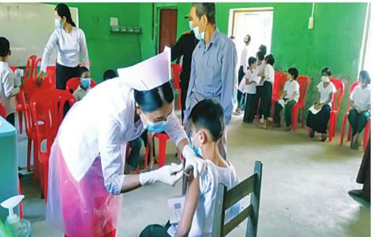
ရောဂါတိုင်းဒေသကြီး ခရိုင်မြို့နယ်အတွင်းရှိ ကျောင်းသား၊ ကျောင်းသူများကို ကိုဗစ်-၁၉ ရောဂါကာကွယ်ဆေးထိုးနှံပေးခြင်း

ကာကွယ်ဆေးထိုးနှံပေးခြင်းများဆောင်ရွက်ပေးသည်။ ထို့အတူ ကျောင်းသား၊ ကျောင်းသူများကိုလည်း ကိုဗစ်-၁၉ ရောဂါကာကွယ်ဆေးထိုးနှံပေးလျက်ရှိရာ ယနေ့တွင် ရောဂါတိုင်းဒေသကြီးအတွင်းရှိ မြို့နယ် ၂၆ မြို့နယ်တို့၌ ကျောင်းသားကျောင်းသူ ၁၄၁၂ ဦးနှင့် မန္တလေးတိုင်းဒေသကြီးအတွင်းရှိ ခရိုင် ၃ ခရိုင်တွင် ကျောင်းသား၊ ကျောင်းသူ ၃၂၇ ဦးကို တပ်မတော်မှ ဆေးအဖွဲ့များက ပြည်သူ့ဆေးရုံများမှ ဆရာဝန်များ၊ သက်ဆိုင်ရာ ကျန်းမာရေးဝန်ထမ်းများ၊ စေတနာ့ဝန်ထမ်းများနှင့် ပူးပေါင်း၍ ကိုဗစ်-၁၉ ရောဂါကာကွယ်ဆေးထိုးနှံခြင်းများ ဆောင်ရွက်ပေးခဲ့ကြောင်း သတင်းရရှိသည်။