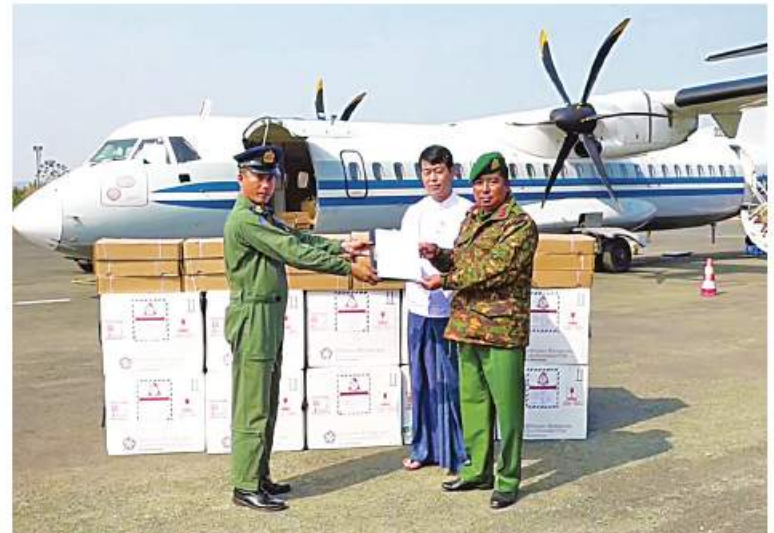
မြစ်ကြီးနားမြို့သို့ရောက်ရှိလာသည့် ကိုဗစ်-၁၉ ရောဂါ ကာကွယ်ဆေးနှင့် ဆေးထိုးအပ်များကို တာဝန်ရှိသူများက လက်ခံရယူစဉ်။

ကိုဗစ်-၁၉ ရောဂါ ကာကွယ် ထိန်းချုပ်၊ တုသရေလုပ်ငန်းများတွင် အဓိကကျသည့် ကိုဗစ်-၁၉ ရောဂါကာကွယ်ဆေးထိုးခြင်း လုပ်ငန်းများကို တပ်မတော်သားဆရာဝန်များ၊ ကျန်းမာရေးဝန်ထမ်းများ၊ လူမှုရေးအသင်းအဖွဲ့များပူးပေါင်း၍ နိုင်ငံတစ်ဝန်းတွင် အင်တိုက်အားတိုက်ဆောင်ရွက်ပေးလျက်ရှိရာ ၎င်းလုပ်ငန်းများတွင်အထောက်အကူဖြစ်စေရန်အတွက် ကိုဗစ်-၁၉ ရောဂါကာကွယ်ဆေးများကို သတ်မှတ်အအေးလမ်းကြောင်း စံချိန်စံညွှန်းများအတိုင်း တိုင်းဒေသကြီးနှင့် ပြည်နယ်အသီးသီးသို့ တပ်မတော်လေယာဉ်များ၊ ရဟတ်ယာဉ်များ၊ Cold Chain Delivery Logistics မော်တော်ယာဉ်ကြီးများဖြင့် ပို့ဆောင်ဖြန့်ဖြူးပေးလျက်ရှိသည်။