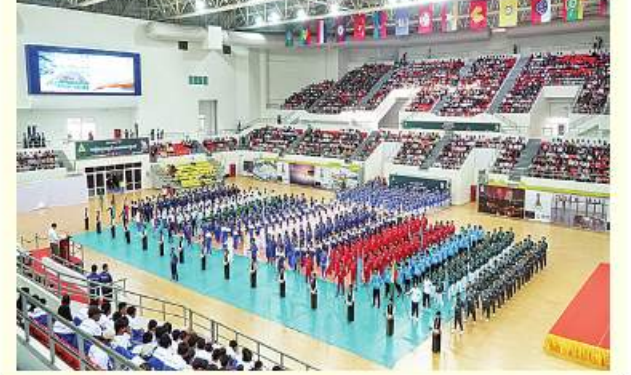
၂၀၂၂ - ၂၀၂၃ ပညာသင်နှစ် အခြေခံပညာကျောင်းသားအားကစားပွဲတော် ဖွင့်ပွဲကျင်းပ

ပီယက်နမ်သမ္မတ ငယ်ရွှန်ဖု ရာထူးမှ နတ်ထွက်