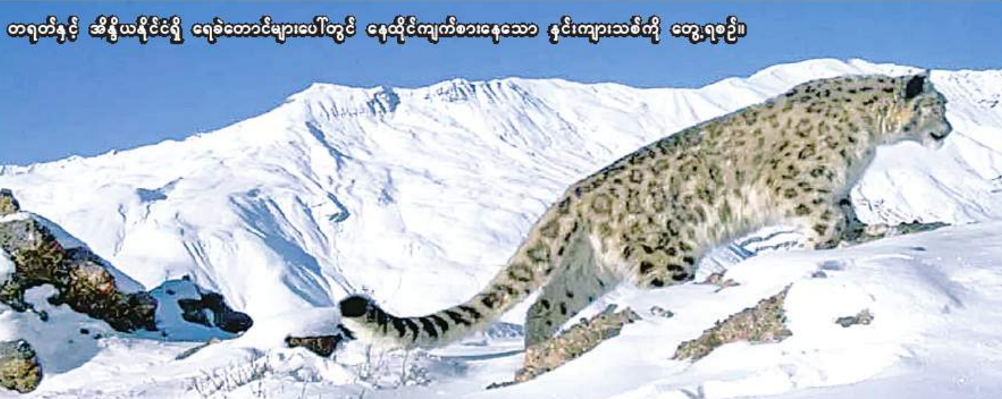
တရုတ်နှင့် အိန္ဒိယနိုင်ငံရှိ ရေခဲတောင်များပေါ်တွင် နေထိုင်ကျက်စားနေသော နှင်းကျားသစ်ကို တွေ့ရစဉ်။

ရန်ကုန် ဇန်နဝါရီ ၁၇ ကမ္ဘာပေါ်ရှိ ဆီးနှင်းဖုံးလွှမ်းသော ဗဟိုအာရှ နိုင်ငံ ၁၂ နိုင်ငံတွင် အကောင်ရေ ၃၀၀၀ မှ ၆၀၀၀ ကျော်သာ ကျန်ရှိသော နှင်းကျားသစ် (Snow Leopard) မြန်မာနိုင်ငံမြောက်ပိုင်းရှိ ခါကာဘိုရာဇီ အမျိုးသားဥယျာဉ်ဧရိယာအတွင်း တည်ရှိကျက်စား မှုရှိမရှိကို ခါကာဘိုရာဇီအမျိုးသားဥယျာဉ်မှ ဝန်ထမ်း များနှင့် အမေရိကန်အခြေစိုက် Panthera Corporation မှ ပညာရှင်များပူးပေါင်း၍ သုတေသန ပြုနိုင်ခဲ့ကြောင်း သိရသည်။ အပြည်ပြည်ဆိုင်ရာ သဘာဝအရင်းအမြစ်များ ထိန်းသိမ်းရေးအဖွဲ့ (International Union for Conservation of Nature) စာမျက်နှာ ၁၈ ကော်လံ ၁ ဇ။