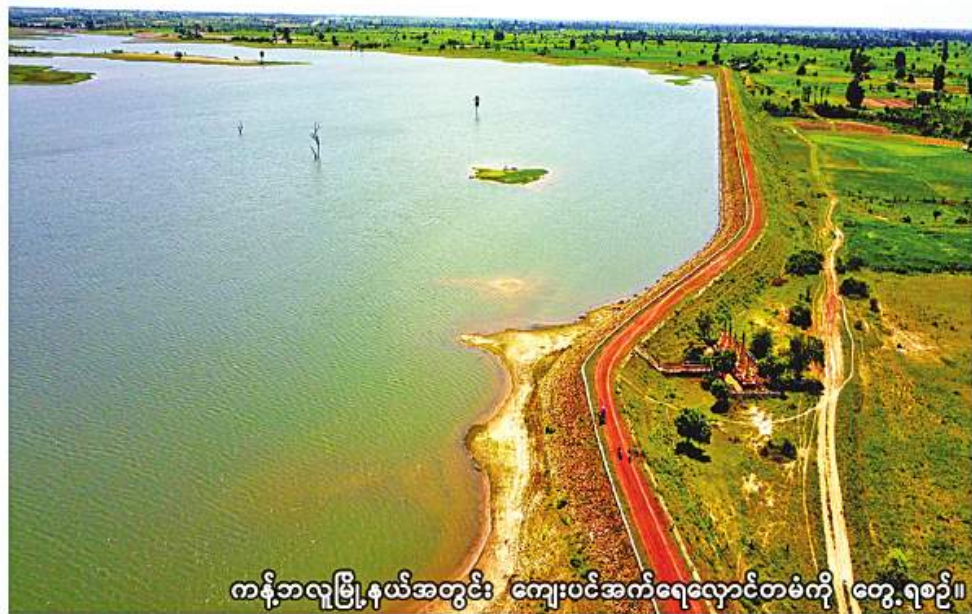
ကန်ဘလူမြို့နယ်အတွင်း ကျေးပင်အက်ရေလှောင်တံမံကို တွေ့ရစဉ်။

ကန်ဘလူ ဇန်နဝါရီ ၁၇ စစ်ကိုင်းတိုင်းဒေသကြီး ကန်ဘလူမြို့နယ်အတွင်းရှိ ရေလှောင်တံမံငါးခုနှင့် လျှပ်စစ်ရေတင်လုပ်ငန်းတစ်ခုတို့မှ နွေစပါးကေ ၂၆၅၁၀ အတွက် ဖေဖော်ဝါရီလ ပထမပတ်တွင် စိုက်ပျိုးရေးများ စတင်ပေးဝေသွားမည်ဖြစ်ကြောင်း ကန်ဘလူမြို့နယ် ဆည်မြောင်းနှင့် ရေအသုံးချမှုစီမံခန့်ခွဲရေးဦးစီးဌာနမှ သိရသည်။ ကန်ဘလူမြို့နယ် ဆည်မြောင်းနှင့် ရေအသုံးချမှုစီမံခန့်ခွဲရေးဦးစီးဌာန