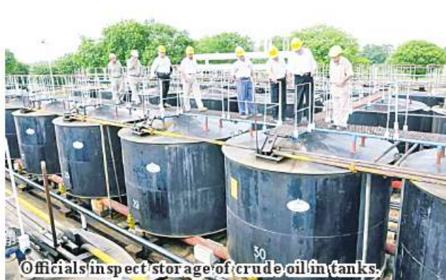
Officials inspect storage of crude oil in tanks.