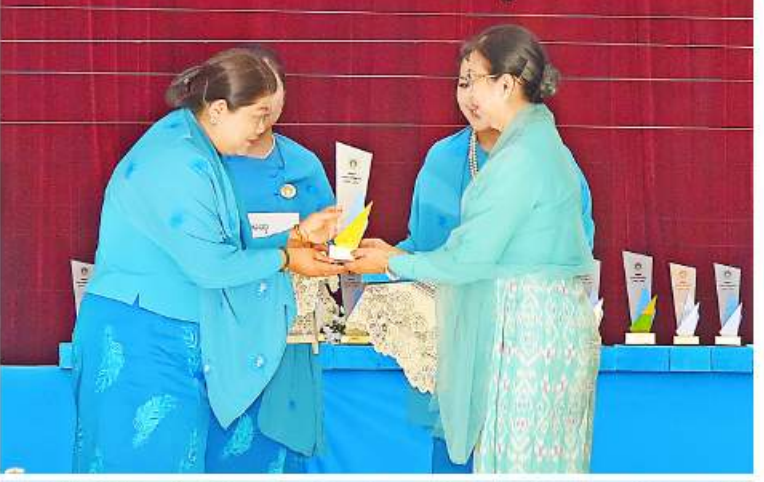
မြန်မာနိုင်ငံအမျိုးသမီးရေးရာအဖွဲ့ချုပ် ဂုဏ်ထူးဆောင်နာယက နိုင်ငံတော်စီမံအုပ်ချုပ်ရေးကောင်စီဥက္ကဋ္ဌ နိုင်ငံတော်ဝန်ကြီးချုပ်၏ဦးစီး ဒေါ်ကြူကြူလှက လွှမ်းမိုးမှုနှင့်ဆောင်ရွက်မှုအကောင်းဆုံးဆုနှင့် ပထမဆုရ ရှမ်းပြည်နယ်မှ ကိုယ်စားလှယ်တစ်ဦးကို ဆုပေးအပ်ချီးမြှင့်စဉ်။

နှင့် ဂုဏ်ထူးဆောင်နာယကများဖြစ်သည့် ဒေါ်ခင်သက်ဌေးနှင့် ဒေါ်သန်းသန်းနွယ်တို့သည် အခမ်းအနားသို့တက်ရောက်လာကြသူများနှင့်အတူ စုပေါင်းမှတ်တမ်းတင်ဓာတ်ပုံ ရိုက်ပြီး မြန်မာနိုင်ငံအမျိုးသမီးရေးရာအဖွဲ့ချုပ်၏ လှုပ်ရှားဆောင်ရွက်မှု မှတ်တမ်းဓာတ်ပုံများကို လှည့်လည်ကြည့်ရှုကြသည်။ ယင်းနောက် မြန်မာနိုင်ငံအမျိုးသမီးရေးရာအဖွဲ့ချုပ် (၁၉)ကြိမ်မြောက် နှစ်ပတ်လည်အစည်းအဝေး နေ့လယ်ပိုင်း (ပထမပိုင်းအစီအစဉ်)ကို ဆက်လက်ကျင်းပရာ မြန်မာနိုင်ငံအမျိုးသမီးရေးရာအဖွဲ့ချုပ် ဥက္ကဋ္ဌ ဒေါက်တာသက်သက်ခိုင်က အမှာစကားပြောကြားပြီး သဘာပတိအဖြစ် ဆောင်ရွက်သည်။ ဆက်လက်၍ နေပြည်တော်၊ တိုင်းဒေသကြီး၊ ပြည်နယ် အမျိုးသမီးရေးရာအဖွဲ့များက နှစ်နှစ်တာကာလအတွင်း ဆောင်ရွက်ချက်များကို တင်ပြကြပြီး တင်ပြချက်များအပေါ် သဘာပတိက ပြန်လည်သုံးသပ်ခဲ့သည်။ ဆက်လက်၍ အစည်းအဝေးနေ့လယ်ပိုင်း