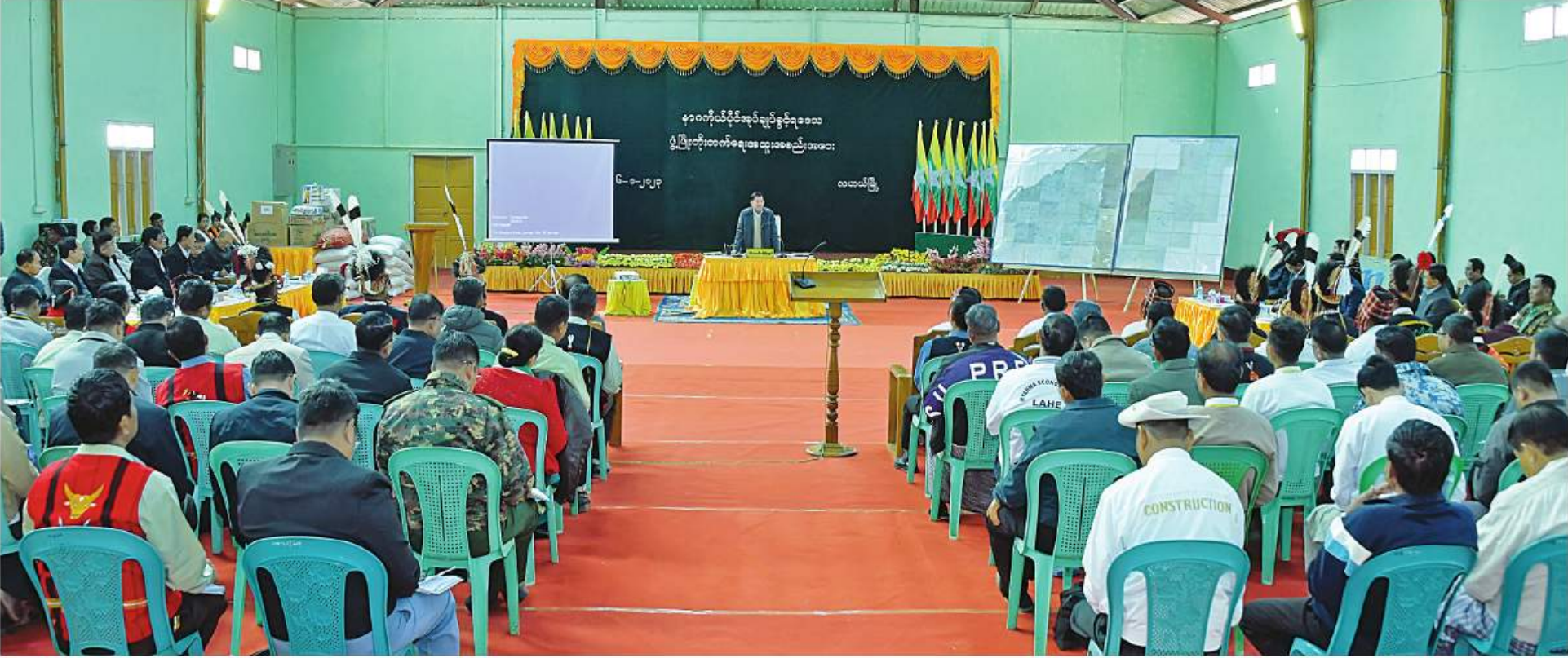
နိုင်ငံတော်စီမံအုပ်ချုပ်ရေးကောင်စီဥက္ကဋ္ဌ နိုင်ငံတော်ဝန်ကြီးချုပ် ပိုလ်ချုပ်မှူးကြီးမင်းအောင်လှိုင် နာဂကိုယ်ပိုင်အုပ်ချုပ်ခွင့်ရဒေသဖွံ့ဖြိုးတိုးတက်ရေးအထူးအစည်းအဝေးတွင် နာဂကိုယ်ပိုင်အုပ်ချုပ်ခွင့်ရဒေသ ဖွံ့ဖြိုးတိုးတက်ရေးဆိုင်ရာများကို ဆွေးနွေးမှာကြားစဉ်။

နေပြည်တော် ၁၆ မာလာတောင်အားကစားခန်းမ၌ ကျင်းပပြုလုပ်ရာ နာဂကိုယ်ပိုင်အုပ်ချုပ်ခွင့်ရဒေသဖွံ့ဖြိုးတိုးတက်ရေးအထူးအစည်းအဝေးကို ယနေ့နံနက်ပိုင်းတွင် နာဂကိုယ်ပိုင်အုပ်ချုပ်ခွင့်ရဒေသ လဟယ်မြို့ ရောက်၍ နာဂကိုယ်ပိုင်အုပ်ချုပ်ခွင့်ရဒေသ ဖွံ့ဖြိုးတိုးတက်ရေးဆိုင်ရာများကို ဆွေးနွေးမှာကြားသည်။ ရဲဝင်းဦး၊ ကောင်စီဝင် ပိုလ်ချုပ်ကြီးမြထွန်းဦး၊ Jeng Phang နော်တောင်၊ ပြည်ထောင်စုဝန်ကြီး များဖြစ်ကြသည့် ဦးဝင်းရှိန်၊ ဦးလှမိုး၊ ဦးသောင်းဟန်၊ စာမျက်နှာ ၁၆ ကော်လံ ၁ B