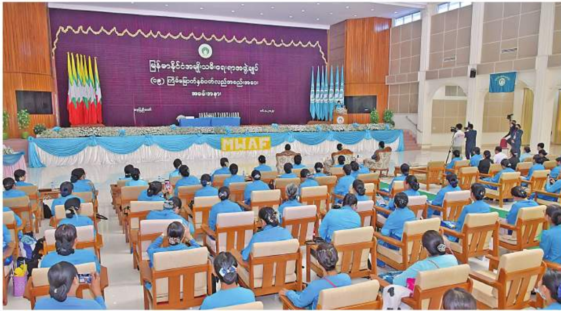
မြန်မာနိုင်ငံအမျိုးသမီးရေးရာအဖွဲ့ချုပ် (၁၉)ကြိမ်မြောက် နှစ်ပတ်လည်အစည်းအဝေး ကျင်းပစဉ်။