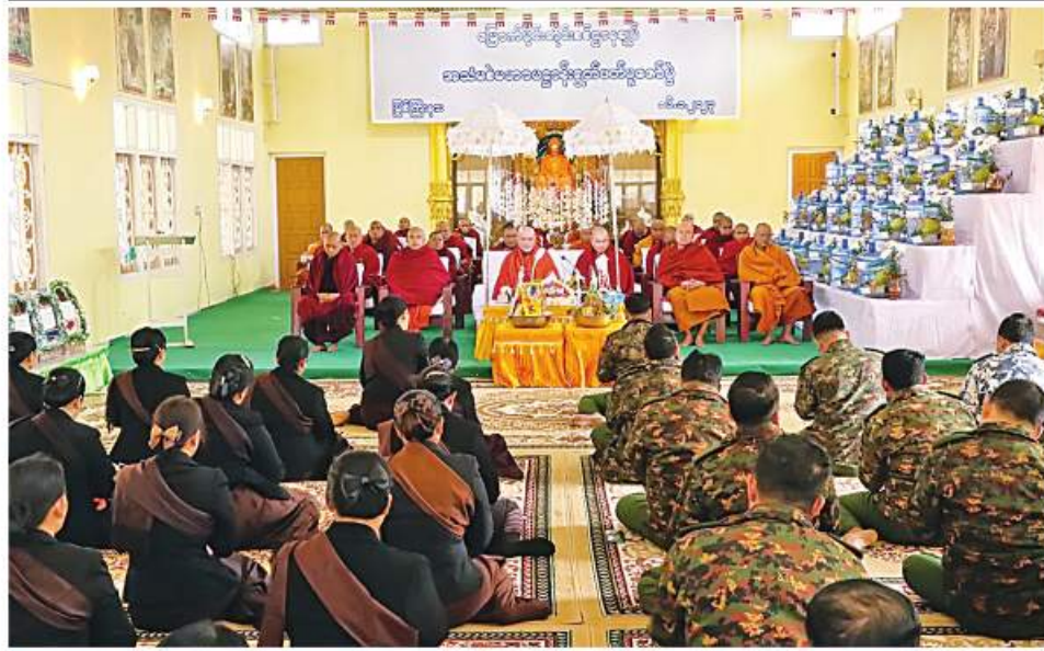
မြောက်ပိုင်းတိုင်းစစ်ဌာနချုပ်၏ အသံမစဲမဟာပဌာန်း ရွတ်ဖတ်ပူဇော်ပွဲပိတ်ပွဲ ကျင်းပစဉ်။