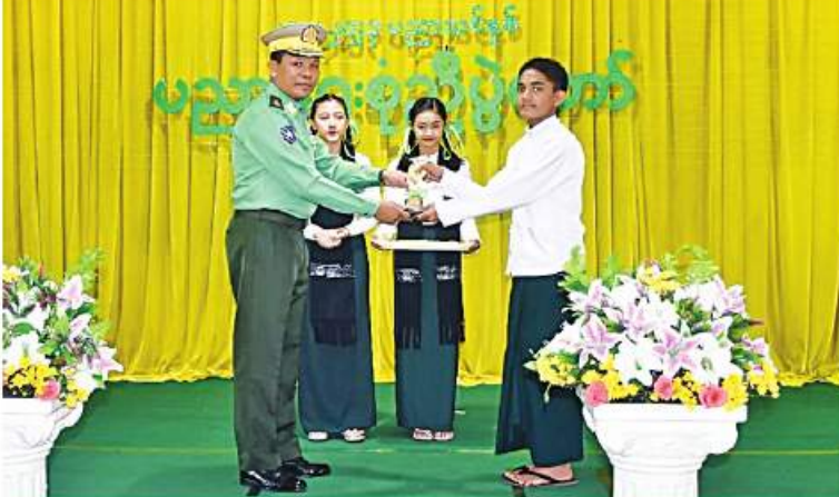
အရှေ့တောင်တိုင်းစစ်ဌာနချုပ် တိုင်းမှူး ဝင်းဇော်ဝင်းက ဝင်းဇော်ဝင်းအား ဝဏ္ဏကျော်ထင်ဘွဲ့ လက်ရောက်ချီးမြှင့်အပ်နှံခြင်းပင်။

နေပြည်တော် ဇန်နဝါရီ ၁၆ မွန်ပြည်နယ် မော်လမြိုင်မြို့ အခြေခံပညာအထက်တန်းကျောင်း(ရွှေတော်တောင်) ၏ ၂၀၂၂-၂၀၂၃ ပညာသင်နှစ် ပညာရေးစုံညီပွဲတော်ကို ယနေ့နံနက်ပိုင်းတွင် အဆိုပါကျောင်းရှိ တေဇဆောင်၌ပြုလုပ်ရာ အရှေ့တောင်တိုင်းစစ်ဌာနချုပ် တိုင်းမှူး ဝင်းဇော်ဝင်းက ဝဏ္ဏကျော်ထင်ဘွဲ့နှင့် အဖွဲ့ဝင်များ၊ ဌာနဆိုင်ရာတာဝန်ရှိသူများ၊ ဆရာ၊ ဆရာမများ၊ ကျောင်းသား၊ ကျောင်းသူများ၊ ကျောင်းသားမိဘများနှင့် ဖိတ်ကြားထားသူများ တက်ရောက်ကြသည်။ ဦးစွာ ကျောင်းသား၊ ကျောင်းသူများက “စုံညီပွဲတော်တို့နွှဲပျော်” တေးသီချင်းဖြင့် သီဆိုဖျော်ဖြေကြသည်။ ထို့နောက် တိုင်းမှူးက အမှာစကားပြောကြားပြီး ပညာရေးစုံညီပွဲတော်အတွက် အလှူငွေများပေးအပ်ရာ တာဝန်ရှိသူများက လက်ခံရယူကြကာ ဂုဏ်ပြုမှတ်တမ်းလွှာ ပြန်လည်ပေးအပ်သည်။ ယင်းနောက် တိုင်းမှူးနှင့် တာဝန်ရှိသူများက ထူးချွန်ဆုရ ကျောင်းသား၊ ကျောင်းသူများအား ဆုများအသီးသီးပေးအပ်ချီးမြှင့်ကြပြီး တက်ရောက်လာကြသူများနှင့်အတူ ကျောင်းသား၊ ကျောင်းသူများ၏ သီဆိုဖျော်ဖြေမှုများကို ကြည့်ရှုအားပေးခဲ့ကြကြောင်း သတင်းရရှိသည်။