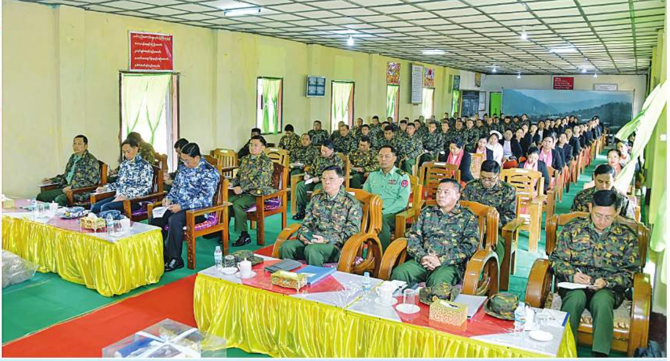
နိုင်ငံတော်စီမံအုပ်ချုပ်ရေးကောင်စီဥက္ကဋ္ဌ တပ်မတော်ကာကွယ်ရေးဦးစီးချုပ် ဝင်းအောင်လှိုင် လဟယ်မြို့ နယ်မြေခံတပ်မှ အရာရှိ၊ စစ်သည်၊ မိသားစုများကို တွေ့ဆုံအမှာစကားပြောကြားစဉ်။

နေပြည်တော် ဇန်နဝါရီ ၁၆ မင်းအောင်လှိုင်သည် ကာကွယ်ရေးဦးစီးချုပ်(ရေ) ရုံးမှ တပ်မတော်အရာရှိကြီးများ၊ အနောက်မြောက် တိုင်းစစ်ဌာနချုပ် လဟယ်မြို့ရှိ နယ်မြေခံတပ်နှင့် နိုင်ငံတော်စီမံအုပ်ချုပ်ရေးကောင်စီ ဥက္ကဋ္ဌ ပိုလ်ချုပ်ကြီးမင်းအောင်လှိုင်၊ ကာကွယ်ရေးဦးစီးချုပ်(လေ) တိုင်းစစ်ဌာနချုပ် တိုင်းမှူးနှင့် တာဝန်ရှိသူများ တွေ့ဆုံအမှာစကားပြောကြားရာတွင် ဟုမ္မလင်းတပ်နယ်တို့မှ အရာရှိ၊ စစ်သည်၊ မိသားစုတပ်မတော်ကာကွယ်ရေးဦးစီးချုပ် ပိုလ်ချုပ်မှူးကြီး ပိုလ်ချုပ်ကြီးထွန်းအောင်၊ ကာကွယ်ရေးဦးစီးချုပ် လိုက်ပါ၍ ယနေ့မှန်းလွဲပိုင်းတွင် အနောက်မြောက် များကို