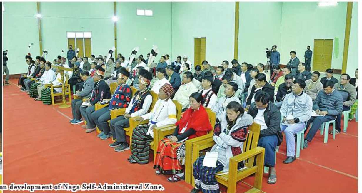
Senior General Min Aung Hlaing addresses special meeting on development of Naga Self-Administered Zone.