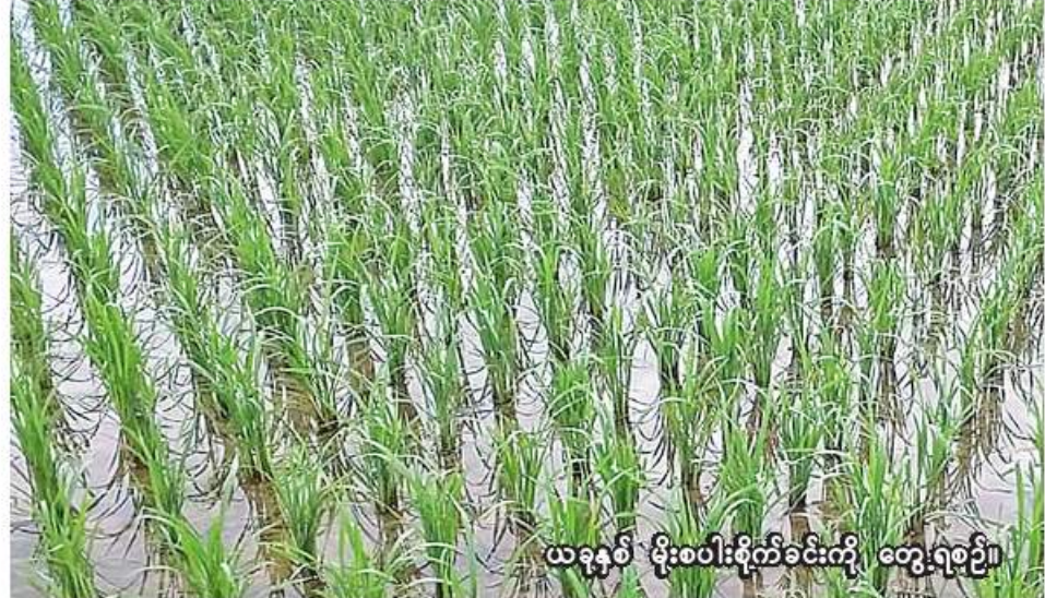
ယခုနှစ် ရိုးစပါးစိုက်ခင်းကို တွေ့ရစဉ်။