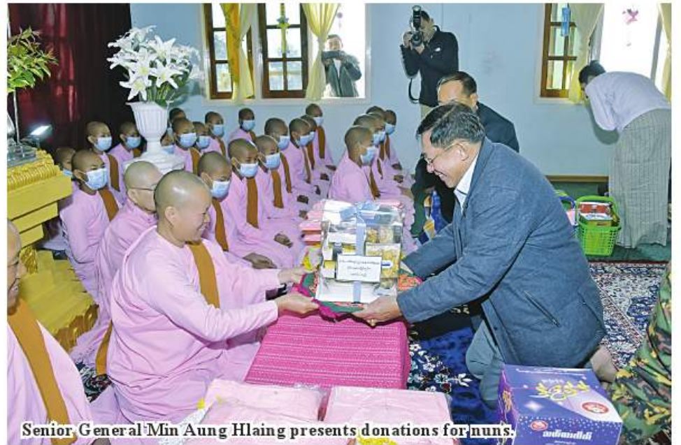
Senior General Min Aung Hlaing presents donations for nuns.

Later, the Senior General took a tour of the Buddhist missionary nunnery and fulfilled the needs. The Senior General also gave necessary instructions to the officials for long-term durability and existence of the nunnery. 100