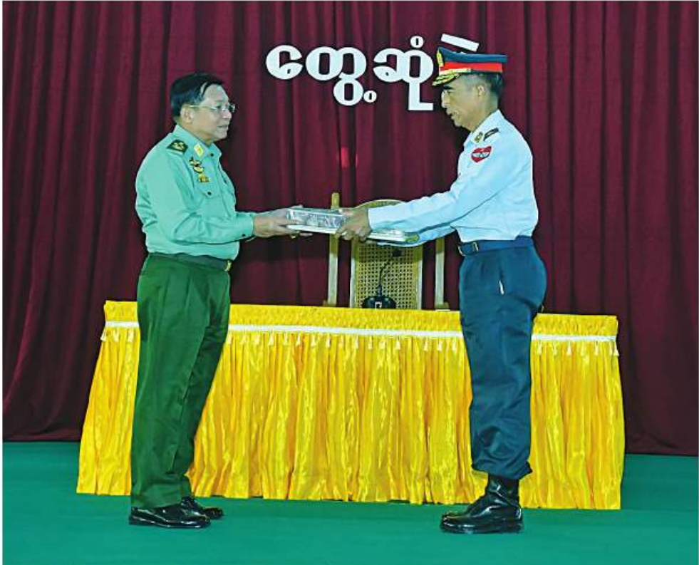
နိုင်ငံတော်စီမံအုပ်ချုပ်ရေးကောင်စီဥက္ကဋ္ဌ တပ်မတော်ကာကွယ်ရေးဦးစီးချုပ် ဗိုလ်ချုပ်မှူးကြီးမင်းအောင်လှိုင် ဟုမ္မလင်းတပ်နယ်မှ အရာရှိ၊ စစ်သည်၊ မိသားစုများအတွက် စားသောက်ဖွယ်ရာပစ္စည်းများပေးအပ်စဉ်။

ထိန်းသိမ်းကြရန်လိုကြောင်း၊ အလားတူ ကျန်းမာရေးကိုထိခိုက်စေနိုင်သည့် ဆေးလိပ် နှင့် ကွမ်းသုံးစွဲမှုများကိုလည်း ရှောင်ကြဉ် ကြရန်လိုကြောင်း၊ နေထိုင်စားသောက်မှုများ အဆင်ပြေစေရေးအတွက် တပ်မတော်မှ စီမံဆောင်ရွက်ပေးထားသကဲ့သို့ တပ်ပိုင် စိုက်ပျိုးမွေးမြူရေးနှင့် တစ်ပိုင်တစ်နိုင် စိုက်ပျိုးမွေးမြူရေး လုပ်ငန်းများကိုလည်း အောင်မြင်ဖြစ်ထွန်းအောင် ဆောင်ရွက်ကြ ရန်လိုကြောင်း၊ ဝတ်ရေးနှင့်နေရေးအတွက် လည်း စာမျက်နှာ ၁၉ သို့