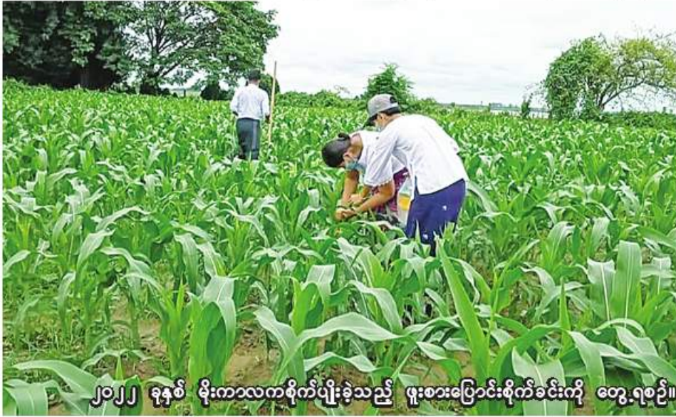
၂၀၂၂ ခုနှစ် မိုးကာလကစိုက်ပျိုးခဲ့သည့် ဖူးစားပြောင်းစိုက်ခင်းကို တွေ့ရစဉ်။

မုံရွာ ဇန်နဝါရီ ၁၆ ဦးစီးဌာန တိုင်းဒေသကြီးဦးစီးမှူး ဦးဝင်းလှိုင်ဦးက ပြောပြ၍ သိရသည်။ ဟုမ္မလင်းခရိုင်တွင် ဆောင်းသီးနှံစိုက်ပျိုးရာသီ၌ ဖူးစားပြောင်း ၅၈၄ ဧက စိုက်ပျိုးပြီးစီးပြီဖြစ်ကြောင်း ၆၈၅ ဧကနှင့် ခန္တီးခရိုင်တွင် ၃၀၀ တို့ စိုက်ပျိုးရန်လျာထားပြီး