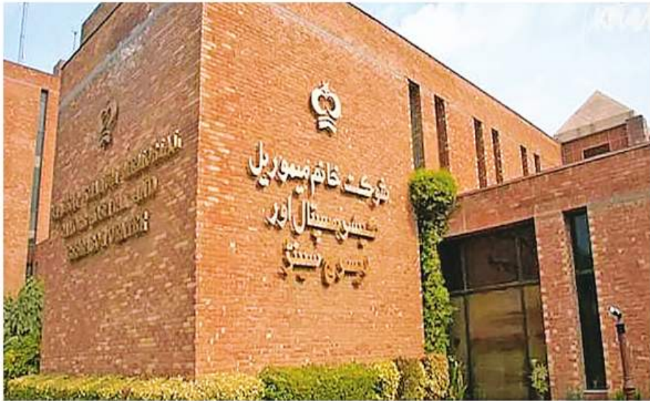
လာဟိုမြို့ရှိ Shaukat Khanum အမှတ်တရကင်ဆာဆေးရုံကို တွေ့ရစဉ်။

Shaukat Khanum အမှတ်တရ ကင်ဆာဆေးရုံ နှင့်သုတေသနဌာနတွင် ကမ္ဘာ့အဆင့်မီ ကင်ဆာရောဂါ ရွာဖွေရေး၊ ကုသရေးနှင့်ဘက်စုံကုသမှုများပေးစွမ်း နိုင်ရန် ကြိုးပမ်းနေကြသည်။ အလှူငွေဖြင့် ရပ်တည် ထားသည့်အတွက် လူနာဘက်မှကုန်ကျစရိတ်ကျခံရန် မလိုဘဲ အကောင်းဆုံးကုသမှုများကို စိတ်ချလက်ချ ရရှိနိုင်သည်။ ကင်ဆာကုသရေးပိုင်းအတွက်သာမက ဆရာဝန်၊ သူနာပြုများအတွက် စဉ်ဆက်မပြတ် ဆေးပညာသင်ကြားမှုများ၊ ပါကစ္စတန်နိုင်ငံတစ်ဝန်း ကင်ဆာရောဂါနှင့်ပတ်သက်သည့် အသိပညာပေး သုတ ကျွမ်းပြနည်းစာရေးနှင့် ကင်ဆာဆေးလက်တွေ့ သုတေသနများ ဆောင်ရွက်နိုင်ရေးထိ မျှော်မှန်း ဆောင်ရွက်ခဲ့ကြသည်။