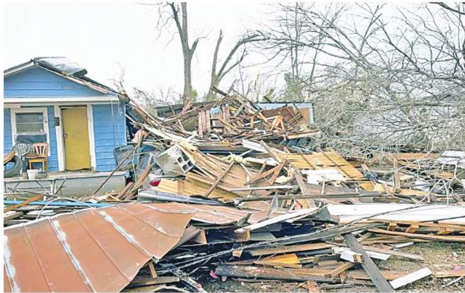
ဝါရှင်တန် ဇန်နဝါရီ ၁၆

လေဆင်နှာမောင်းဝင်ရောက် တိုက်ခတ်ခဲ့သည့် အမေရိကန်နိုင်ငံ အလာဘားမားပြည်နယ်ကိုသဘာဝဘေးအန္တရာယ် အရေးပေါ်အခြေအနေအဖြစ် သမ္မတဂျိုးဘိုင်ဒင်က အတည်ပြု လက်ခံပေးခဲ့ကြောင်း ထုတ်ပြန်ခဲ့သည်ဟု US News သတင်းဌာနက ယနေ့တွင် ရေးသား