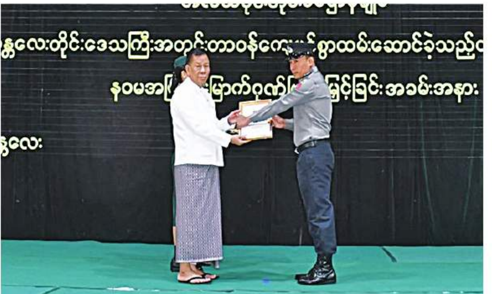
မန္တလေးတိုင်းဒေသကြီးဝန်ကြီးချုပ် ဦးမောင်ကို လုံခြုံရေးတပ်ဖွဲ့ဝင်များကို ဂုဏ်ပြုတမ်းလွှာနှင့် နဝမအကြိမ်မြောက်ဂုဏ်ပြုချီးမြှင့်ခြင်းအခမ်းအနား။

နေပြည်တော် ဇန်နဝါရီ ၁၆ မန္တလေးတိုင်းဒေသကြီးအတွင်း တာဝန်ကျေပွန်စွာ ထမ်းဆောင်ခဲ့သည့် လုံခြုံရေးတပ်ဖွဲ့ဝင်များအား နဝမအကြိမ် ဂုဏ်ပြုချီးမြှင့်ပွဲကို ယနေ့နံနက်ပိုင်းတွင် အလယ်ပိုင်းတိုင်းစစ်ဌာနချုပ် အားကစားခန်းမ၌ ပြုလုပ်ရာ တိုင်းဒေသကြီးဝန်ကြီးချုပ် ဦးမောင်ကို၊ တိုင်းမှူး ဝိုလ်ချုပ်ကိုကိုမောင်နှင့် တိုင်းဒေသကြီးဝန်ကြီးများ၊ တိုင်းစစ်ဌာနချုပ်မှ အရာရှိကြီးများ၊ လုံခြုံရေးတပ်ဖွဲ့ ဝင်များ တက်ရောက်ကြသည်။ ဦးစွာ တိုင်းဒေသကြီးဝန်ကြီးချုပ်က ဂုဏ်ပြုအမှာ