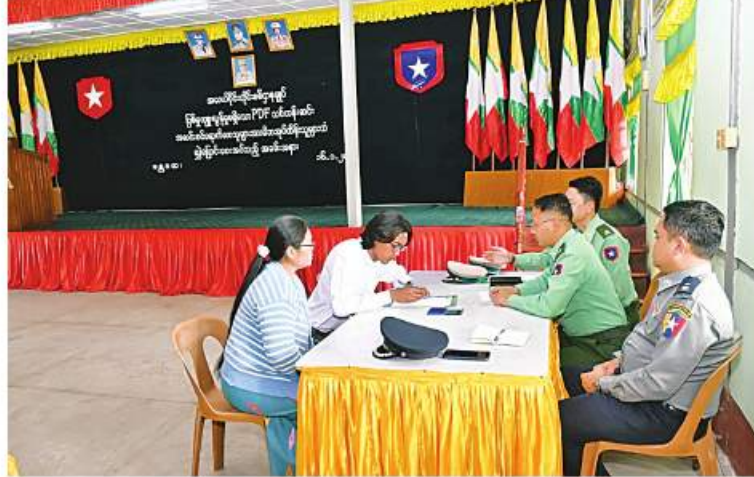
ဥပဒေဘောင်အတွင်းဝင်ရောက်လာသည့် ပြစ်မှုကျူးလွန်ခြင်းမရှိခဲ့သော PDF အဖွဲ့ဝင် အမျိုးသား ကိုးဦးကို ၎င်းတို့၏ မိဘအုပ်ထိန်းသူများထံ လွှဲပြောင်းပေးအပ်ပွဲ ကျင်းပစဉ်။

နေပြည်တော် ဇန်နဝါရီ ၁၆ တိုင်းရင်းသား လက်နက်ကိုင်အဖွဲ့ နယ်မြေအတွင်း သင်တန်းများတက်ရောက် ခဲ့ပြီး ပြစ်မှုကျူးလွန်ခြင်းမရှိခဲ့သည့် ဥပဒေဘောင်အတွင်း ဝင်ရောက်လာသော PDF အဖွဲ့ဝင်များကို ပြန်လည်ကြိုဆို လက်ခံ၍ ၎င်းတို့၏ မိဘအုပ်ထိန်းသူများ ထံသို့ လွှဲပြောင်းပေးအပ်လျက်ရှိသည်။ ယနေ့ နေ့လယ်ပိုင်းတွင်လည်း မန္တလေး တိုင်းဒေသကြီး အောင်မြေသာစံမြို့နယ် နယ်မြေခံသင်တန်းကျောင်းခန်းမ၌ ပြန်လည် ကြိုဆိုလက်ခံခြင်းအခမ်းအနားကို ပြုလုပ် ရာ အလယ်ပိုင်းတိုင်းစစ်ဌာနချုပ်မှ တာဝန်ရှိသူများ၊ ခရိုင်၊ မြို့နယ်စီမံအုပ်ချုပ် ရေးအဖွဲ့ဝင်များ၊ ဌာနဆိုင်ရာတာဝန်ရှိ သူများ၊ ဥပဒေဘောင်အတွင်းဝင်ရောက်