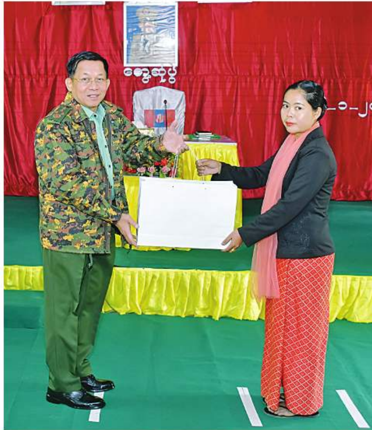
နိုင်ငံတော်စီမံအုပ်ချုပ်ရေးကောင်စီဥက္ကဋ္ဌ တပ်မတော်ကာကွယ်ရေးဦးစီးချုပ် ဗိုလ်ချုပ်မှူးကြီးမင်းအောင်လှိုင် လဟယ်မြို့ရှိ နယ်မြေခံတပ်မှ အရာရှိ၊ စစ်သည်၊ မိသားစုများအတွက် စားသောက်ဖွယ်ရာပစ္စည်းများပေးအပ်ရာ စစ်သည်မိသားစုဝင်တစ်ဦးက လက်ခံရယူစဉ်။

မြင့်မားရေးအတွက်လည်း အားပေးဆောင်ရွက်ကြရန်လိုကြောင်း၊ သို့မှသာ ၎င်းတို့၏ ဘဝတိုးတက်ရေးအတွက် ဆောင်ရွက်နိုင်ကြမည်ဖြစ်ကြောင်း၊ သားသမီးများ၏ ပညာရည်မြင့်မားရေးအတွက် အားပေးဆောင်ရွက်၍ မိဘကောင်းများဖြစ်အောင် ဆောင်ရွက်ကြစေလိုပြီး ကောင်းမွန်သည့် ပညာအမွေကို ပေးနိုင်ရမည်ဖြစ်ကြောင်းဖြင့် မှာကြားသည်။