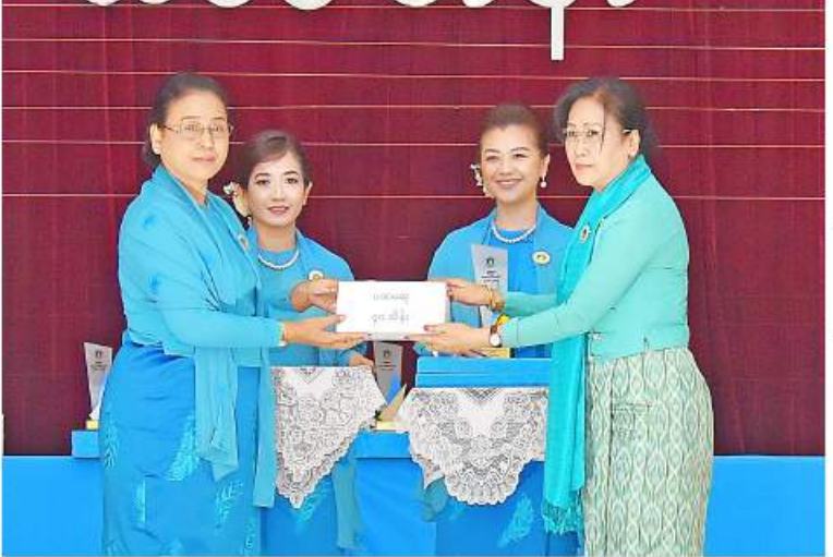
မြန်မာနိုင်ငံအမျိုးသမီးရေးရာအဖွဲ့ချုပ် ဂုဏ်ထူးဆောင်နာယက ဒေါ်ခင်သက်ဌေးက လွှမ်းမိုးမှုအကောင်းဆုံးဆုနှင့် ပထမဆုရ ကျပ်ပြည်နယ်မှ ကိုယ်စားလှယ်တစ်ဦးကို ဆုပေးအပ်ချီးမြှင့်စဉ်။

အမျိုးသမီးများနှင့် ပညာရေး၊ ကျန်းမာရေး၊ စီးပွားရေး၊ မီဒီယာ၊ သဘာဝပတ်ဝန်းကျင်၊ အမျိုးသမီးများအပေါ် အကြမ်းဖက်မှု၊ အရေးပေါ်အခြေအနေနှင့် ပဋိပက္ခဒေသအတွင်းရှိ အမျိုးသမီးများအတွက် လုပ်ငန်းရပ်များ ဆောင်ရွက်ပေးလျက်ရှိရာမှာ မြန်မာနိုင်ငံအမျိုးသမီးရေးရာအဖွဲ့ချုပ်နှင့် လည်း ပူးပေါင်းပါဝင်ဆောင်ရွက်လျက် ရှိသည်ကို သိရှိရသည့်အတွက် လှိုက်လှိုက်လှဲလှဲ ဂုဏ်ယူဝမ်းမြောက်မိပါကြောင်းနှင့် အမျိုးသမီးများ ဖွံ့ဖြိုးတိုးတက်ရေးဆိုင်ရာ အမျိုးသားအဆင့် မဟာဗျူဟာစီမံကိန်း (၂၀၂၃-၂၀၃၂) NSPAW Phase 2 ရေးဆွဲရေးကို ဆက်လက်ဆောင်ရွက်သွားရမှာဖြစ်ပါကြောင်း၊ အမျိုးသမီးများ ဖွံ့ဖြိုးတိုးတက်ရေးအတွက် အာဆီယံဆိုင်ရာလုပ်ငန်းများအပါအဝင် လူမှုဝန်ထမ်းလုပ်ငန်းများကို အကောင်အထည်ဖော်ဆောင်ရွက်ရာမှာ ကော်မတီအဖွဲ့ဝင် အစိုးရမဟုတ်သော အဖွဲ့အစည်းများ၏