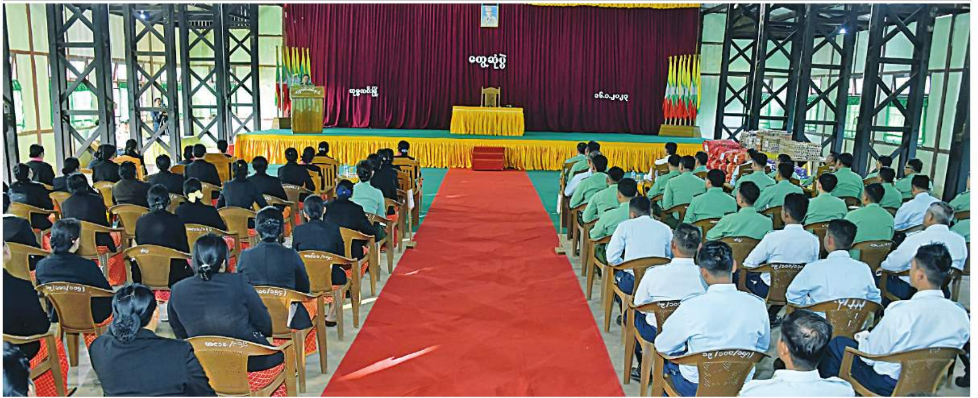
နိုင်ငံတော်စီမံအုပ်ချုပ်ရေးကောင်စီဥက္ကဋ္ဌ တပ်မတော်ကာကွယ်ရေးဦးစီးချုပ် ဗိုလ်ချုပ်မှူးကြီးမင်းအောင်လှိုင် ဟုမ္မလင်းတပ်နယ်မှ အရာရှိ၊ စစ်သည်၊ မိသားစုများအား တွေ့ဆုံအမှာစကားပြောကြားစဉ်။

ကျောပုံးမှအဆက် သီးခြားစီတွေ့ဆုံအမှာစကားပြောကြားသည်။