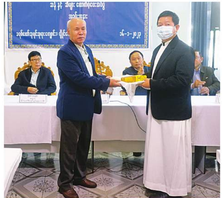
နိုင်ငံတော်စီမံအုပ်ချုပ်ရေးကောင်စီအဖွဲ့ဝင် စောဒန်နီယယ် ကယားပြည်နယ်အတွင်းရှိ ခရစ်ယာန်ဘုန်းတော်ကြီးကျောင်းများနှင့် သီလရှင်ကျောင်းများသို့ ဆန်နှင့် ဆီများ ထောက်ပံ့လှူဒါန်းစဉ်