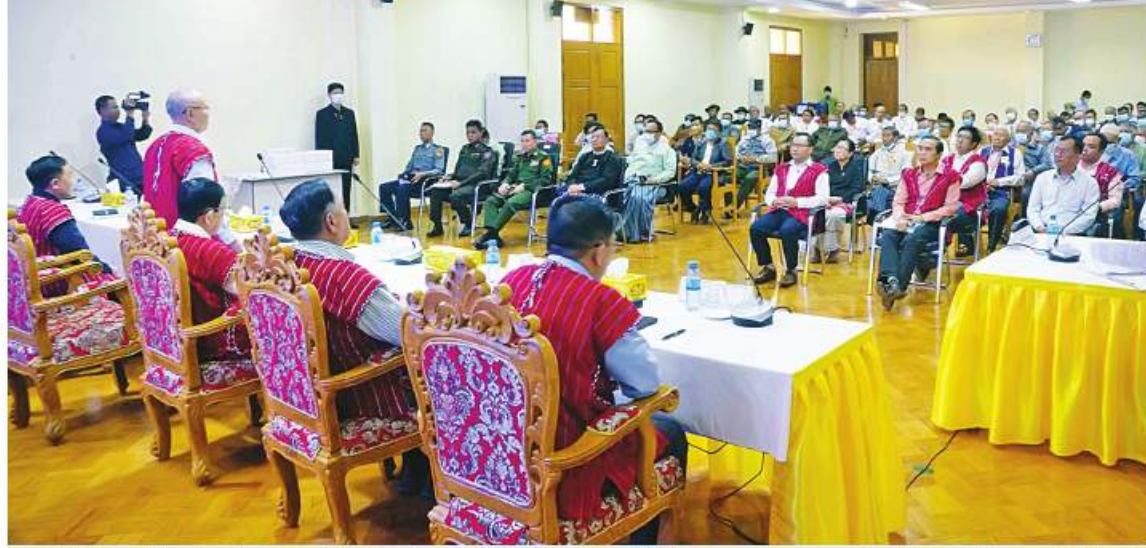
နိုင်ငံတော်စီမံအုပ်ချုပ်ရေးကောင်စီအဖွဲ့ဝင်များနှင့် ပြည်ထောင်စုဝန်ကြီးများ ဘာသာရေးအဖွဲ့ခေါင်းဆောင်များ၊ ပြည်သူ့စစ် ခေါင်းဆောင်များ၊ ငြိမ်းချမ်းရေးအဖွဲ့များနှင့် တွေ့ဆုံစဉ်