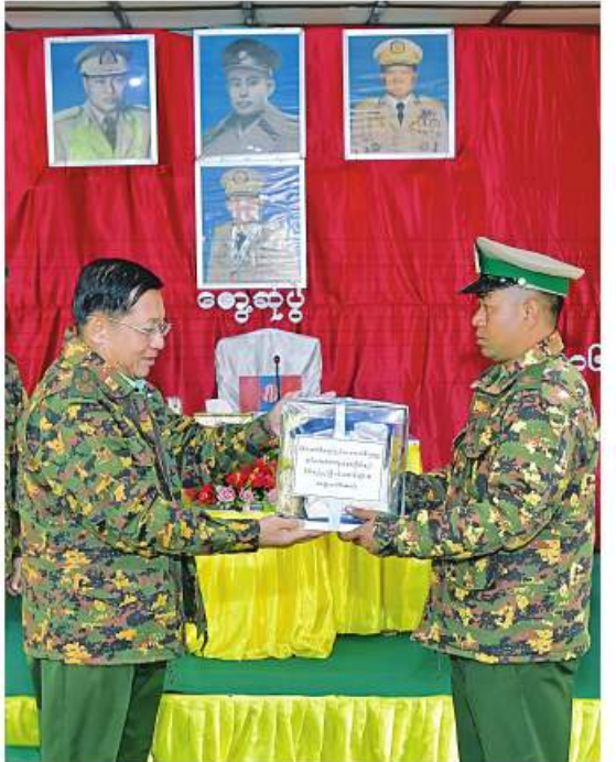
နိုင်ငံတော်စီမံအုပ်ချုပ်ရေးကောင်စီဥက္ကဋ္ဌ တပ်မတော် ကာကွယ်ရေးဦးစီးချုပ် ဗိုလ်ချုပ်မှူးကြီးမင်းအောင်လှိုင် လဟယ် မြို့ရှိ နယ်မြေခံတပ်မှ အရာရှိ၊ စစ်သည်၊ မိသားစုများအတွက် စားသောက်ဖွယ်ရာပစ္စည်းများပေးအပ်ရာ တာဝန်ရှိသူတစ်ဦးက လက်ခံရယူစဉ်။