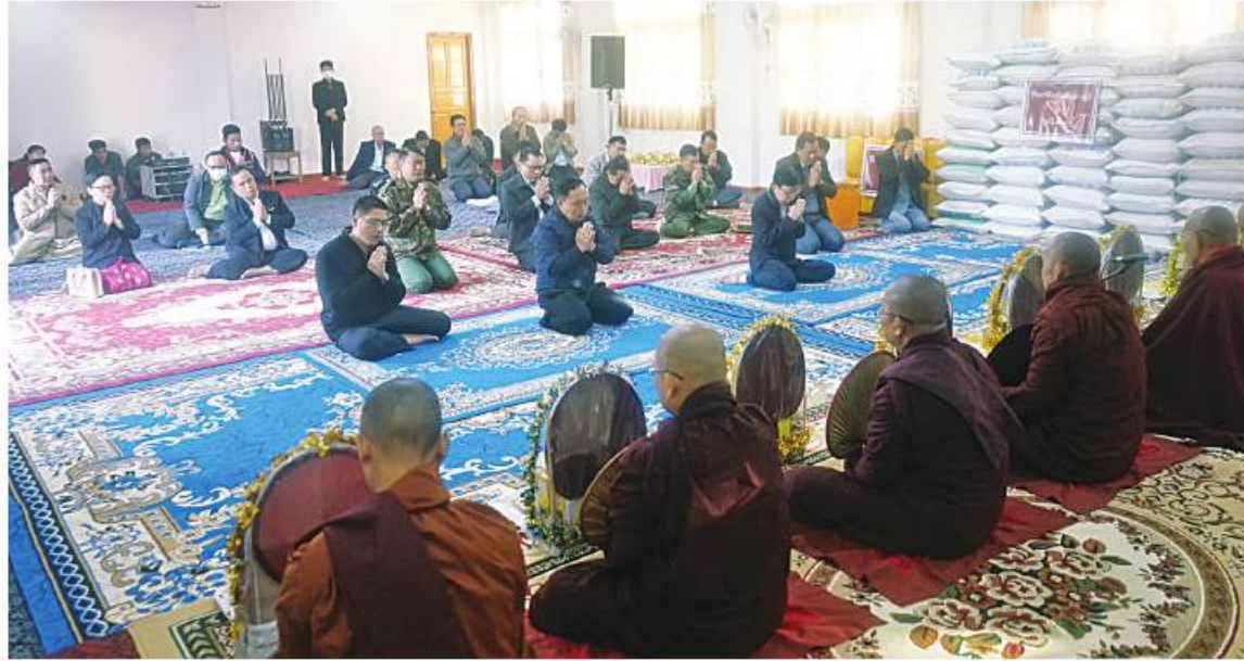
နိုင်ငံတော်စီမံအုပ်ချုပ်ရေးကောင်စီအဖွဲ့ဝင်များနှင့် ပြည်ထောင်စုဝန်ကြီးများ ကျောင်းထိုင်ဘုန်းကြီးသင်တန်းကျောင်းသို့ သွားရောက်၍ ဆရာတော်ကြီးများအား ဖူးမြော်ကြည်ညိုကြဉ်း

လွိုင်ကော် ဇန်နဝါရီ ၁၆ နိုင်ငံတော်စီမံအုပ်ချုပ်ရေး ကောင်စီ အဖွဲ့ဝင် စောဒန်နီယယ်၊ ဦးစိုင်းလုံးဆိုင်၊ ဦးရွှေကြိမ်း၊ ပြည်ထောင်စုဝန်ကြီး ဒုတိယ ဝန်ကြီးထွန်းထွန်းနောင်နှင့် ဦးစော ထွန်းအောင်မြင့်၊ ကယားပြည်နယ်ဝန်ကြီးချုပ် ဦးဇော်မျိုးတင်၊ အရှေ့ပိုင်းတိုင်းစစ်ဌာနချုပ် တိုင်းမှူး ဝိုလ်ချုပ်လှမိုး၊ ဒုတိယဝန်ကြီး ဒေါက်တာအောင်လေးယုနှင့် ဒေါက်တာ အေးထွန်း၊ ပြည်နယ်အစိုးရအဖွဲ့ဝင်များနှင့် တာဝန်ရှိသူများသည် ယနေ့နံနက်ပိုင်းတွင် ကယားပြည်နယ်အတွင်းရှိ ဘုန်းတော်ကြီး ကျောင်းများနှင့် ခရစ်ယာန်ဘုန်းတော်ကြီး