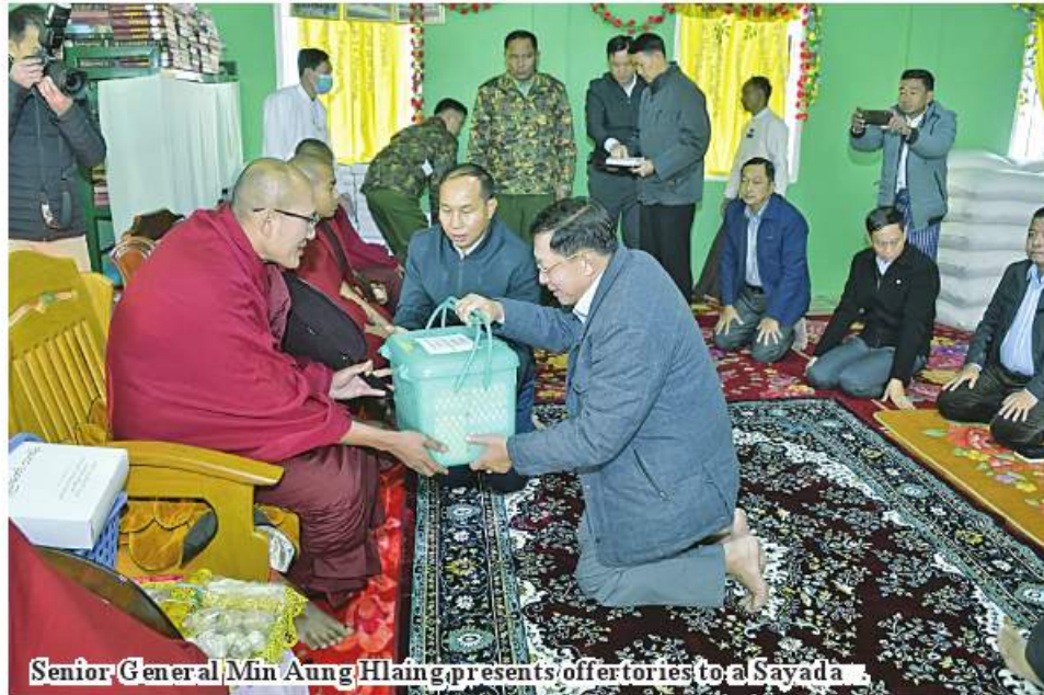
Senior General Min Aung Hlaing presents offertories to a Sayada.

Nay Pyi Taw January 16 Chairman of State Administration Council Prime Minister Senior General Min Aung Hlaing, accompanied by the members of the trip, the Chief Minister of Sagaing Region, the Commander of North-West Command, the Chairman of Naga Self-Administered Zone Admin-