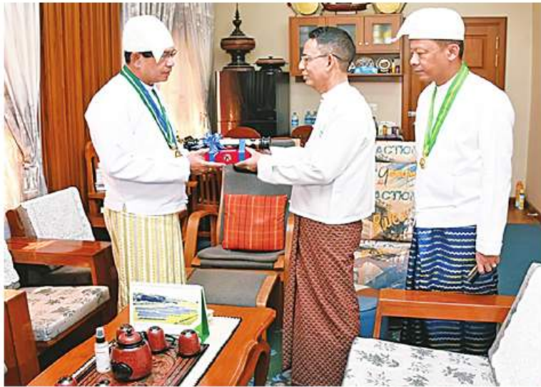
ရန်ကုန်တိုင်းဒေသကြီးဝန်ကြီးချုပ် ဦးစိုးသိန်းနှင့် တိုင်းမှူး ဝင်းဇော်ဝင်းတို့က သီရိပျံချီဘွဲ့ရရှိသူ ပြည်ထောင်စုဝန်ကြီး ဒေါက်တာအောင်သုတံ ဂုဏ်ထူးဆောင်ဘွဲ့ လက်ရောက်ချီးမြှင့်အပ်နှံခြင်းပင်။

နေပြည်တော် ဇန်နဝါရီ ၁၆ (၇၅)နှစ်မြောက် စိန်ရတုလွတ်လပ်ရေး နေ့ ဂုဏ်ထူးဆောင်ဘွဲ့များ ချီးမြှင့်အပ်နှံခြင်းအခမ်းအနားကို ဇန်နဝါရီ ၁ ရက်နှင့် ၂ ရက်တို့တွင် ကျင်းပခဲ့ပြီး နိုင်ငံတော်စီမံအုပ်ချုပ်ရေးကောင်စီဥက္ကဋ္ဌ နိုင်ငံတော်ဝန်ကြီးချုပ်က ဘွဲ့ခံပုဂ္ဂိုလ်များအား ဂုဏ်ထူးဆောင်ဘွဲ့များကို တစ်ဦးချင်းချီးမြှင့်အပ်နှံခဲ့သည်။ အဆိုပါ ဂုဏ်ထူးဆောင်ဘွဲ့များ အပ်နှံခြင်းအခမ်းအနားသို့ အကြောင်းအမျိုးမျိုးကြောင့် ကိုယ်တိုင်သော်လည်းကောင်း၊ ကိုယ်စားသော်လည်းကောင်း တက်ရောက်ရယူနိုင်ခဲ့ခြင်းမရှိဘဲ အဝေးရောက် လက်ခံရယူနိုင်မည့် ဘွဲ့ခံပုဂ္ဂိုလ်များအား နေပြည်တော်ကောင်စီအပါအဝင် သက်ဆိုင်ရာ တိုင်းဒေသကြီးနှင့် ပြည်နယ်များမှ ဝန်ကြီးချုပ်များ၊ တိုင်းမှူးများနှင့် တာဝန်ရှိသူများက ဂုဏ်ထူးဆောင်ဘွဲ့များ လက်ခံရယူမည့် ကာယကံရှင်မိသားစုဝင်များထံသို့ သွားရောက်ချီးမြှင့်အပ်နှံပေးလျက်ရှိသည်။