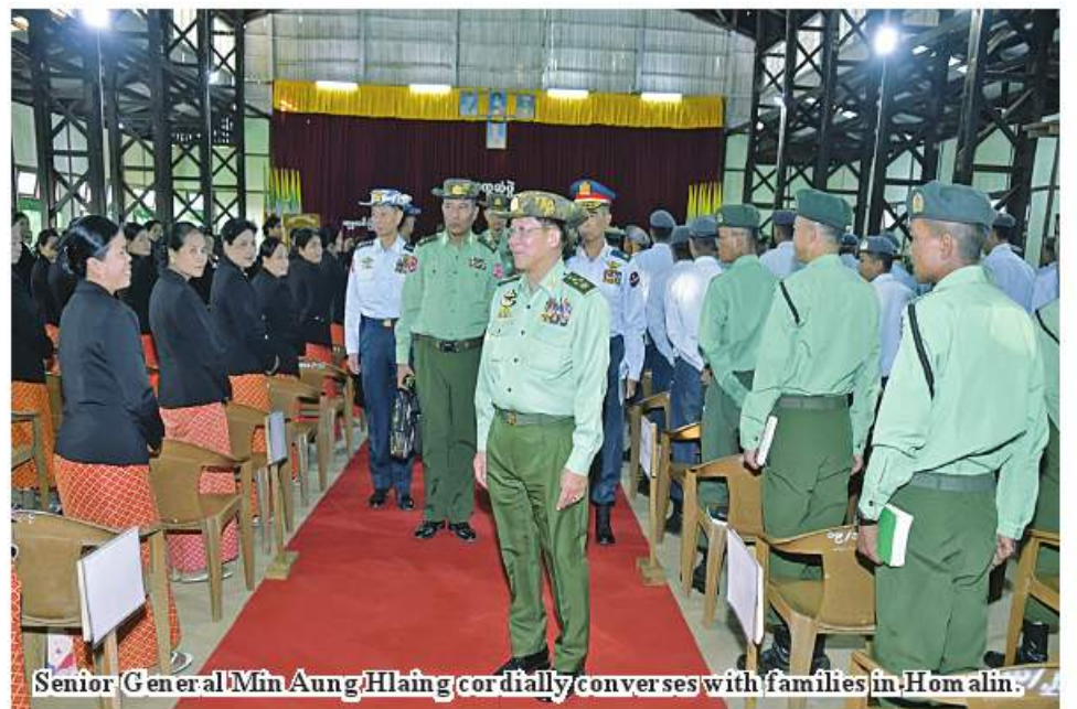
Senior General Min Aung Hlaing cordially converses with families in Homalin.