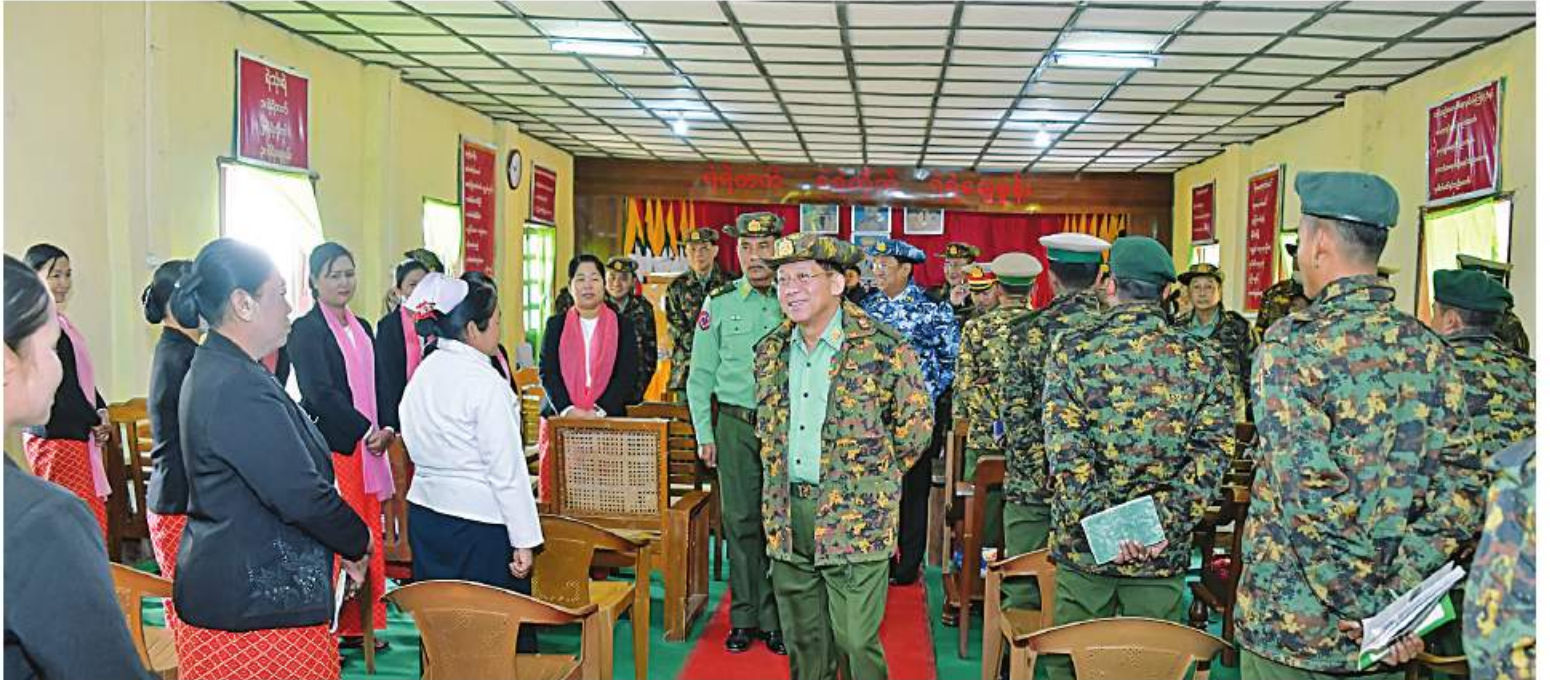
နိုင်ငံတော်စီမံအုပ်ချုပ်ရေးကောင်စီဥက္ကဋ္ဌ တပ်မတော်ကာကွယ်ရေးဦးစီးချုပ် ဗိုလ်ချုပ်မှူးကြီးမင်းအောင်လှိုင် လဟယ်မြို့ နယ်မြေခံတပ်မှ အရာရှိ၊ စစ်သည်၊ မိသားစုများအား ရင်းရင်းနှီးနှီးလိုက်လံနှုတ်ဆက်စဉ်။

မိမိတို့ဘဝတိုးတက်ရေးကို အထောက်အကူပြုစေမည့် ဗဟုသုတများရရှိစေရန် စာအုပ်စာစောင်များကို ဖတ်ရှုလေ့လာနေရန်လိုကြောင်း၊ တပ်ရင်း၊ တပ်ဖွဲ့အသီးသီးရှိ စာကြည့်တိုက်များ၌ စာအုပ်စာစောင်များ အမြဲမပြတ်ရရှိစေရန် စီမံဆောင်ရွက်ပေးထားပြီးဖြစ်ကြောင်း၊ ဘဝတိုးတက်ရေးအမြဲမပြတ်ကြိုးပမ်းဆောင်ရွက်နေကြရန်လိုကြောင်း၊ မိမိတို့သားသမီးများ၏ ပညာရည်