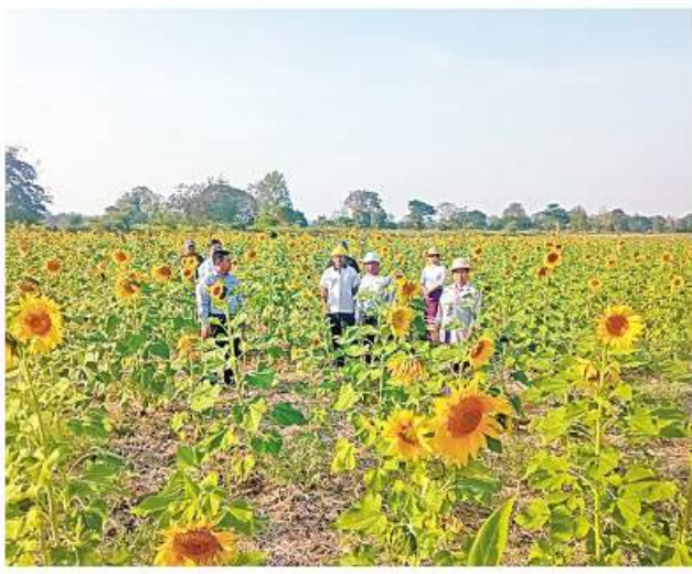
မင်းမြင့်မိုရ်

တက်ရေးဦးစီးဌာန ဒေသမြို့နယ် ဦးစီးမှူး ဒေါ်အေးအေးမာနှင့် ဝန်ထမ်းများက မြောင်ရှည်ကျေးရွာ၌ မြစ်မ်းရောင်ကျေးရွာစီမံကိန်း (ဆီထွက်သီးနှံ)ရန်ပုံငွေဖြင့် ဆောင်ရွက်ထားသော နေကြာစိုက်ပျိုး နေမှုနှင့် လအလိုက်ပြည့်သွင်းရ