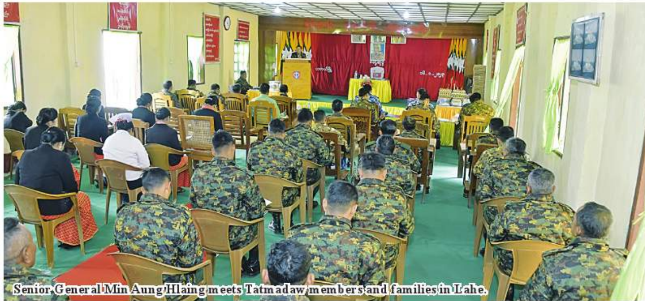
Senior General Min Aung Hlaing meets Tatmadaw members and families in Lahe.