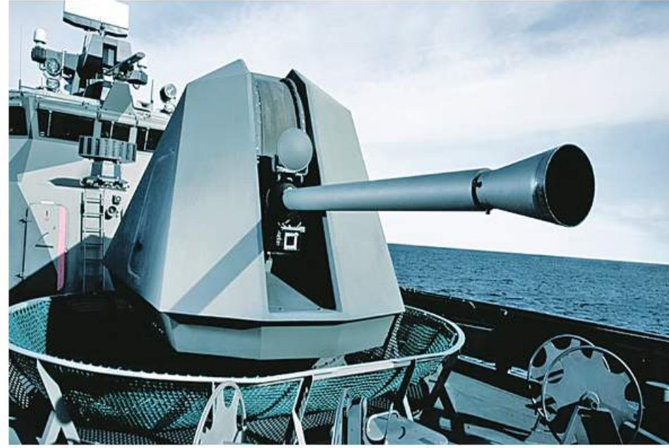
Bofor ၏ 57 mm Mk3 ကို တွေ့ရစဉ်။

၎င်းလက်နက်တွင် 127 mm/5 inches ကျည်များအပြင် Vulcano အုပ်စုခွဲယမ်းများအသုံးပြု၍ လည်းပစ်ခတ်နိုင်ပြီး အကွာအဝေး ကီလိုမီတာ ၁၀၀ ထိ ရောက်ရှိပစ်ခတ်နိုင်သည်။ ၎င်းလက်နက်ကို လက်ရှိအချိန်တွင် အယ်ဂျီးရီးယား၊ အီဂျစ်၊ ဂျာမနီနှင့် အီတလီရေတပ်တို့တွင် အသုံးပြုလျက်ရှိသည်။ တော်ဝင်နယ်သာလန်ရေတပ်သည် ၂၀၂၀ ပြည့်နှစ်တွင် ၎င်း၏ဘက်စုံသုံးဖရိုက်စစ်ရေယာဉ် လေးစီးအတွက် OTO 127/64 LW Vulcano လက်နက်