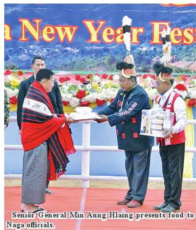
Senior General Min Aung Hlaing presents food to Naga officials.