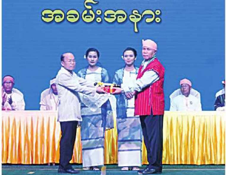
နိုင်ငံတော်စီမံအုပ်ချုပ်ရေးကောင်စီအဖွဲ့ဝင် စောဒန်နီယယ် (၇၅)နှစ်မြောက် စိန်ရတု လွတ်လပ်ရေးနေ့အထိမ်းအမှတ် နိုင်ငံတော်အဆင့်ဂုဏ်ထူးဆောင်ဘွဲ့များ၊ ဂုဏ်ထူးဆောင် တံဆိပ်များ ချီးမြှင့်အပ်နှင်းခြင်းခံရသူများကို ဂုဏ်ထူးဆောင်ဘွဲ့ တံဆိပ်ချိမြှင့်အပ်နှင်းစဉ်။

ဆက်လက်၍ နိုင်ငံတော်စီမံအုပ်ချုပ် ရေးကောင်စီအဖွဲ့ဝင်များ၊ ပြည်ထောင်စု ဝန်ကြီးများ၊ ပြည်နယ်ဝန်ကြီးချုပ်၊ အရှေ့ ပိုင်းတိုင်းစစ်ဌာနချုပ် တိုင်းမှူး၊ ဒုတိယ ဝန်ကြီးတို့က (၇၅)နှစ်မြောက် စိန်ရတု လွတ်လပ်ရေးနေ့အထိမ်းအမှတ် နိုင်ငံတော် အဆင့် ဂုဏ်ထူးဆောင်ဘွဲ့များ၊ ဂုဏ်ထူး ဆောင်တံဆိပ်များ ချီးမြှင့်အပ်နှင်းခြင်းခံ ရသူများကို ဂုဏ်ထူးဆောင်ဘွဲ့တံဆိပ်များ ချီးမြှင့်အပ်နှင်းခြင်း၊ (၇၁)နှစ်မြောက် ကယား ပြည်နယ်နေ့အထိမ်းအမှတ် ဂုဏ်ထူးဆောင် လက်မှတ်ရရှိသူများကို ဂုဏ်ထူးဆောင် လက်မှတ်နှင့် ဆုပစ္စည်းများ ချီးမြှင့်ခြင်း၊ အရှေ့တောင်အာရှ အားကစားပြိုင်ပွဲတွင် ထူးချွန်ဆုရရှိသူများကို ဆုချီးမြှင့်ခြင်းနှင့် နိုင်ငံ့ဝန်ထမ်းတက္ကသိုလ်မှ ဖွင့်လှစ်သော သင်တန်းများနှင့် တိုင်းဒေသကြီးနှင့် ပြည်နယ်အားကစားပြိုင်ပွဲများတွင် ထူးချွန် ဆုရရှိသူများကို ဂုဏ်ပြုဆုများ ချီးမြှင့် ကြရာ ဆုရရှိသူများက လက်ခံရယူ