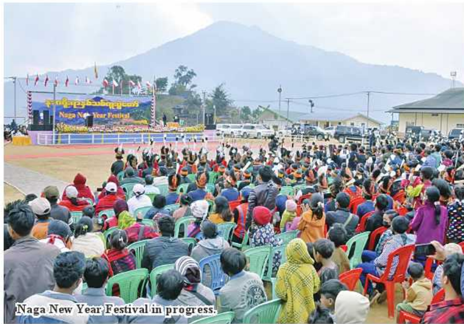
Naga New Year Festival in progress.

Previously, the festival was separately in the townships. Since 1992, it has been held alternatively in the townships. Both local and international tourists come to the festival with enthusiasm and take part in the bonfires.