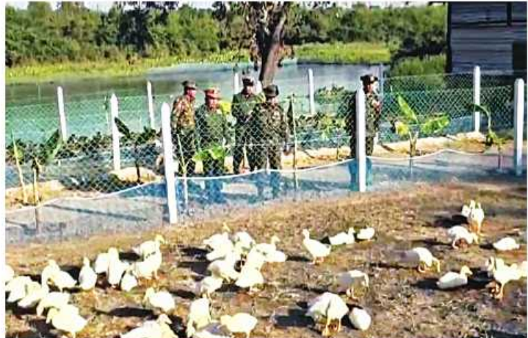
ကာကွယ်ရေးဦးစီးချုပ်ရုံး(ကြည်း)မှ ဒုတိယဗိုလ်ချုပ်ကြီးဖုန်းမြတ် ပဲခူးတပ်နယ် နယ်မြေစံတပ်ရင်းရှိ ဝဲပြဘက်ခိုခိုက်ပျိုးရေးနှင့် မွေးမြူရေးလုပ်ငန်းများကို ကြည့်ရှု စစ်ဆေးစဉ်။

နေပြည်တော် ဇန်နဝါရီ ၁၅ ကုသရေးလုပ်ငန်းများ ဆောင်ရွက်နေချိန် တွင် ဒေသတွင်းစားနပ်ရိက္ခာဖူလုံရေးနှင့်