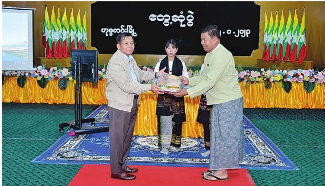
နိုင်ငံတော်စီမံအုပ်ချုပ်ရေးကောင်စီဥက္ကဋ္ဌ နိုင်ငံတော်ဝန်ကြီးချုပ် ဗိုလ်ချုပ်မှူးကြီးမင်းအောင်လှိုင် ခရိုင်၊ မြို့နယ်အဆင့်ဌာနဆိုင်ရာ ဝန်ထမ်းများအတွက် လက်ဆောင်ပစ္စည်းများပေးအပ်စဉ်။

ကျောပိုးမှအဆက် နိုင်ငံတော်ဝန်ကြီးချုပ်နှင့်အတူ ကောင်စီတွဲဖက်အတွင်းရေးမှူး ဒုတိယဗိုလ်ချုပ်ကြီး ရဲဝင်းဦး၊ ကောင်စီဝင် ဗိုလ်ချုပ်ကြီးကြွထွန်းဦး၊ Jeng Phang နော်တောင်၊ ပြည်ထောင်စုဝန်ကြီးများဖြစ်ကြသည့် ဦးဝင်းရီနို၊ ဦးလှမိုး၊ ဦးသောင်းဟန်၊ ဒေါက်တာညွန့်ဖေ၊ ဒေါက်တာသက်ခိုင်ဝင်း၊ စစ်ကိုင်းတိုင်းဒေသကြီးဝန်ကြီးချုပ် ဦးမြတ်ကျော်၊ ကာကွယ်ရေးဦးစီးချုပ်ရုံးမှ တပ်မတော်အရာရှိကြီးများ၊ ခရိုင်၊ မြို့နယ်အဆင့်ဌာနဆိုင်ရာတာဝန်ရှိသူများ၊ မြို့မိမြို့ဖများ၊ ဟုမ္မလင်းခရိုင်အတွင်းရှိ အသေးစား၊ အငယ်စားနှင့် အလတ်စားစီးပွားရေး (MSME) လုပ်ငန်းရှင်များနှင့် တာဝန်ရှိသူများ တက်ရောက်ကြသည်။