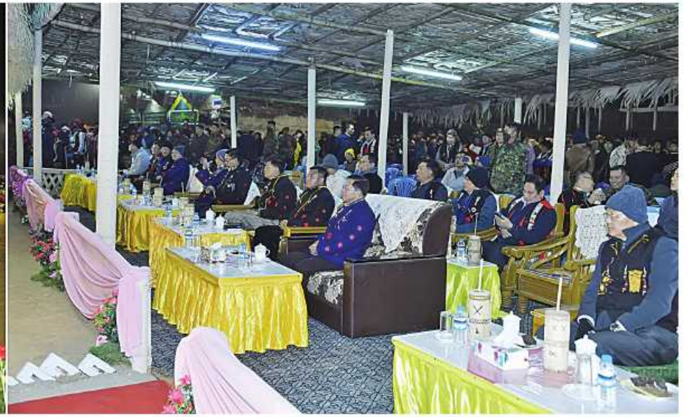
နိုင်ငံတော်စီမံအုပ်ချုပ်ရေးကောင်စီဥက္ကဋ္ဌ နိုင်ငံတော်ဝန်ကြီးချုပ် ဝိုလ်ချုပ်မှူးကြီးမင်းအောင်လှိုင်နှင့် အဖွဲ့ဝင်များ နာဂရိုးရာအကအလှများဖြင့် ဖျော်ဖြေမှုများကို ကြည့်ရှုအားပေးစဉ်။

စာမျက်နှာ ၁၇ မှအဆက် ဌာနဆိုင်ရာ ဝန်ထမ်းများအနေဖြင့်လည်း စေတနာ၊ မေတ္တာအပြည့်ဖြင့် တိုင်းရင်းသား ညီအစ်ကိုမောင်နှမများ လူမှုစီးပွားဘဝ ဘက်စုံဖွံ့ဖြိုးတိုးတက်အောင် ဆောင်ရွက် ပေးကြရမည်ဖြစ်ပါကြောင်း။ နိုင်ငံတော် စီမံအုပ်ချုပ်ရေးကောင်စီ အနေဖြင့် ကိုဗစ်-၁၉ ရောဂါကြောင့် ထိခိုက်ကျဆင်းခဲ့သည့် ပြည်သူလူထု၏ လူမှုစီးပွားဘဝနှင့် နိုင်ငံတော်၏ စီးပွားရေးအခြေအနေကို ပြန်လည်မြှင့်တင် နိုင်ရန်အတွက် နိုင်ငံစီးပွားမြှင့်တင်ရေး ရန်ပုံငွေမှ နာဂကိုယ်ပိုင်အုပ်ချုပ်ခွင့်ရ ဒေသအတွက် ကျပ်ငါးဘီလီယံ မတည် ထောက်ပံ့ပေးမှုများအပေါ် စိုက်ပျိုးရေး၊ မွေးမြူရေးလုပ်ငန်းများနှင့် ပြည်သူလူထု ၏လူမှုဘဝဖွံ့ဖြိုးတိုးတက်ရေးလုပ်ငန်းများ တွင် အကျိုးရှိရှိအောင်မြင်အောင်