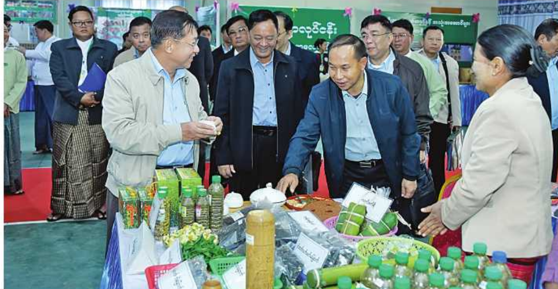
နိုင်ငံတော်စီမံအုပ်ချုပ်ရေးကောင်စီဥက္ကဋ္ဌ နိုင်ငံတော်ဝန်ကြီးချုပ် ဗိုလ်ချုပ်မှူးကြီးမင်းအောင်လှိုင် သယ်စာတတွင်းထွက်ထုတ်ကုန်များ၊ စားသောက်ကုန်၊ လူသုံးကုန်၊ စက်မှုလက်မှုထုတ်ကုန်၊ ရိုးရာလက်မှုထုတ်ကုန်များ၊ အဝတ်အထည်များ၊ တိုင်းရင်းဆေးများ စသည်ထုတ်ကုန်ပစ္စည်းများ ခင်းကျင်းပြသထားရှိမှုများကို ပြကွက်တစ်ခုချင်းစီအလိုက် စိတ်ဝင်တစားလေ့လာစဉ်။

ထို့နောက် နိုင်ငံတော်စီမံအုပ်ချုပ်ရေး ကောင်စီဥက္ကဋ္ဌ နိုင်ငံတော်ဝန်ကြီးချုပ် သည် ခင်းကျင်းပြသထားသည့် သယ်စာတ တွင်းထွက်ထုတ်ကုန်များ၊ စားသောက်ကုန်၊ လူသုံးကုန်၊ စက်မှုလက်မှုထုတ်ကုန်၊ ရိုးရာ လက်မှုထုတ်ကုန်များ၊ အဝတ်အထည်များ၊ တိုင်းရင်းဆေးများ စသည်ထုတ်ကုန် ပစ္စည်းများ ခင်းကျင်းပြသထားရှိမှုများကို ပြကွက်တစ်ခုချင်းစီအလိုက် စိတ်ဝင်တစား မြင့်လေ့လာခဲ့ပြီး ဈေးကွက်ရရှိမှုအခြေအနေ များကိုမေးမြန်းဆွေးနွေးရာ လုပ်ငန်း အလိုက် စီးပွားရေးလုပ်ငန်းရှင်များက လိုက်လံရှင်းလင်း တင်ပြခဲ့ကြကြောင်း သတင်းရရှိသည်။