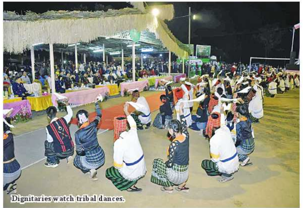
Dignitaries watch tribal dances.