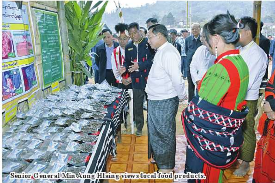
Senior General Min Aung Hlaing views local food products.