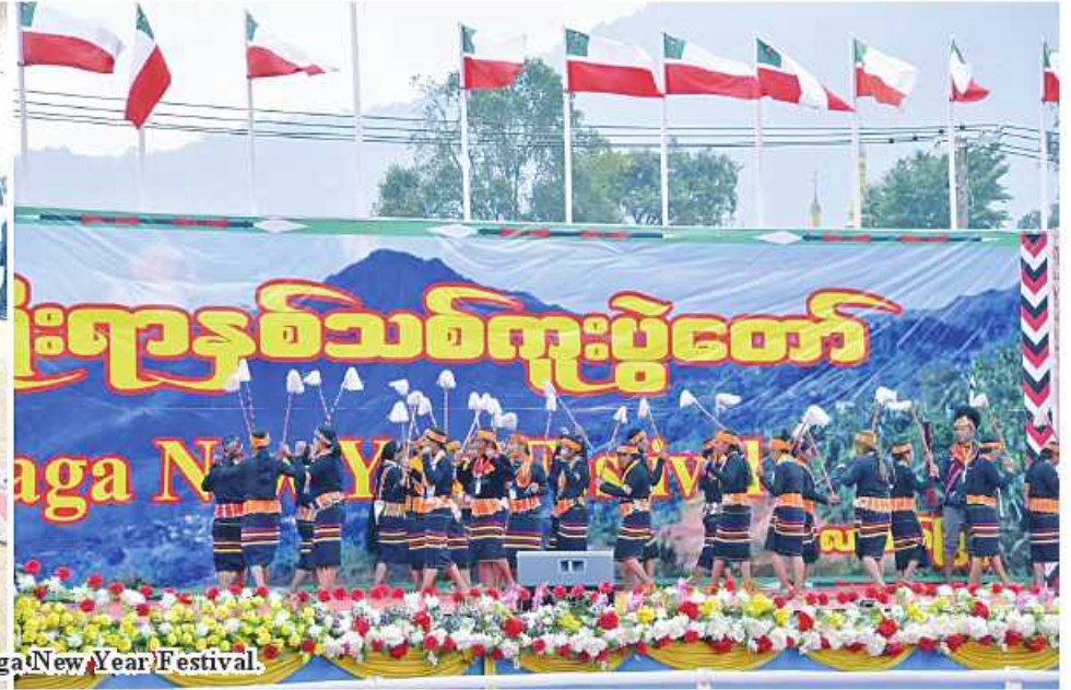
Senior General Min Aung Hlaing applauds as tribal dances are performed at Naga New Year Festival.

Nay Pyi Taw January 15 Chairman of the State Administration Council Prime Minister Senior General Min Aung Hlaing attended the Naga Traditional New Year festival in Lahe of Naga Self-Administered Zone this afternoon.