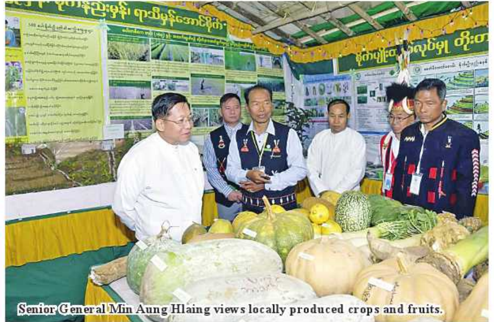
Senior General Min Aung Hlaing views locally produced crops and fruits.