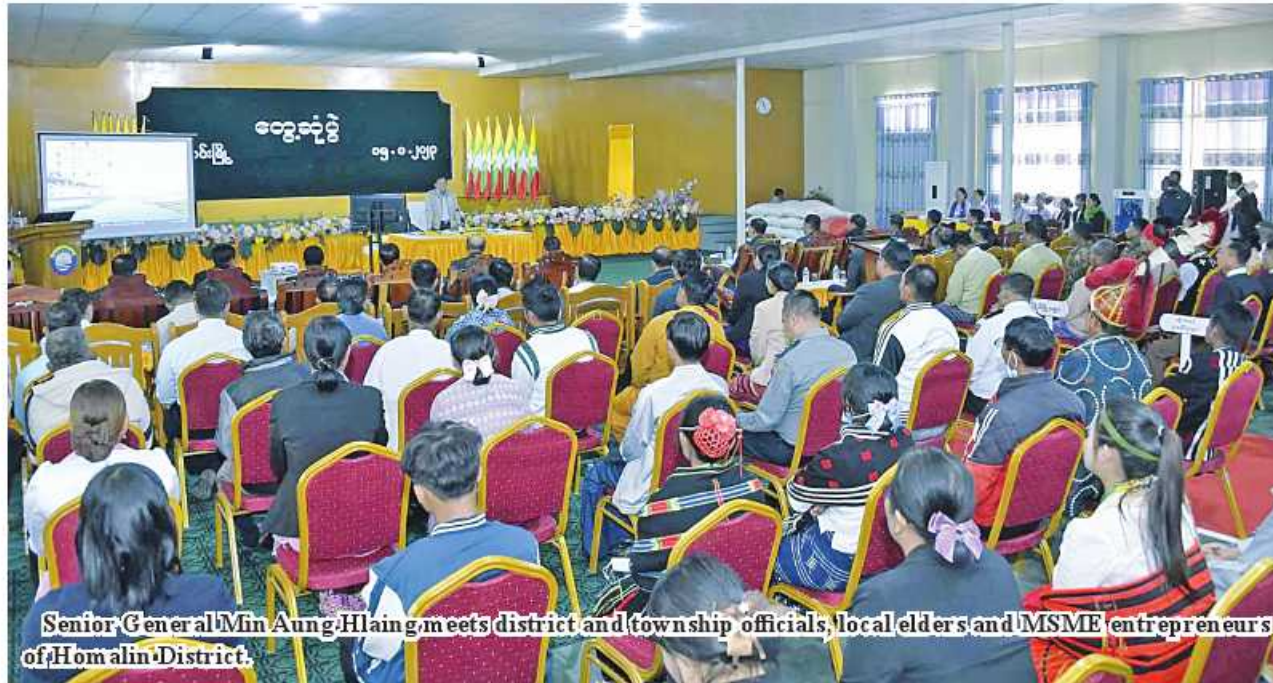
Senior General Min Aung Hlaing meets district and township officials, local elders and MSME entrepreneurs of Homalin District.