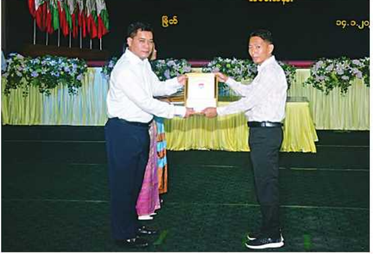
ကမ်းရိုးတန်းဒေသတိုင်းစစ်ဌာနချုပ် တိုင်းမှူး ဗိုလ်ချုပ်စောသန်းလှိုင် တိုင်းစစ်ဌာနချုပ်ကိုယ်စားပြု အားကစားသမားတစ်ဦးကို ဂုဏ်ပြုဆုငွေနှင့် ဂုဏ်ပြု မှတ်တမ်းလွှာ ပေးအပ်ချီးမြှင့်စဉ်။

နေပြည်တော် ဇန်နဝါရီ ၁၅ ပြိုင်ပွဲများတွင် ရွှေတံဆိပ်၊ ငွေတံဆိပ်၊ ကြေးတံဆိပ်ရရှိခဲ့ကြသော အားကစား သမားများနှင့် အသင်းအုပ်ချုပ်သူ နည်းပြ များကို တိုင်းမှူးနှင့် တာဝန်ရှိသူများက ဂုဏ်ပြုဆုငွေနှင့် ဂုဏ်ပြုမှတ်တမ်းများ ပေးအပ်ချီးမြှင့်ကြရာ အားကစားသမား များနှင့် တာဝန်ရှိသူများက လက်ခံရယူ ကြပြီး အားကစားအသင်းများကိုယ်စား ပြေး၊ ခုန်၊ ပစ်အသင်းမှ တာဝန်ရှိသူတစ်ဦး က ကျေးဇူးတင်စကား ပြန်လည်ပြောကြား သည်။ ယင်းနောက် တက်ရောက်လာ ကြသူများကို တေးသီချင်းများဖြင့် ကြိုဆိုပေးခဲ့ကြောင်း သတင်း ရရှိသည်။