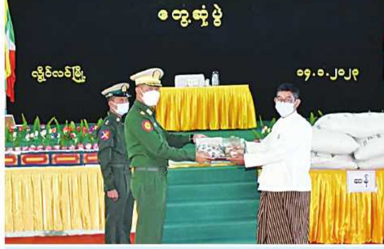
အရှေ့အလယ်ပိုင်းတိုင်းစစ်ဌာနချုပ် တိုင်းမှူး ဗိုလ်ချုပ်မှူးမင်းထွန်း စစ်မှုထမ်း ဟောင်းအဖွဲ့ဝင်များအတွက် ဆန်နှင့် စားသောက်ဖွယ်ရာများပေးအပ်စဉ်။

နေပြည်တော် ဇန်နဝါရီ ၁၅ ရှမ်းပြည်နယ်(တောင်ပိုင်း) လွိုင်လင် မြို့ရှိ စစ်မှုထမ်းဟောင်းအဖွဲ့ဝင်များကို ဇန်နဝါရီ ၁၄ ရက် နံနက်ပိုင်းတွင် အရှေ့ အလယ်ပိုင်းတိုင်းစစ်ဌာနချုပ် တိုင်းမှူး ဗိုလ်ချုပ်မှူးမင်းထွန်းနှင့် အဖွဲ့ဝင်များက လွိုင်လင်မြို့ နယ်မြေစံတပ်ရင်းရှိ နဝရတ် ခန်းမ၌ သွားရောက်တွေ့ဆုံသည်။ ဦးစွာ တိုင်းမှူးက အမှာစကားပြော ကြားသည်။ ထို့နောက် စစ်မှုထမ်းဟောင်း အဖွဲ့ဝင်များ၏ တင်ပြချက်များအပေါ် လိုအပ်သည်များ ပေးပို့ညှိနှိုင်း ဆောင်ရွက်ပေးပြီး စစ်မှုထမ်းဟောင်းအဖွဲ့ ဝင်များအတွက် ဆန်နှင့် စားသောက် ဖွယ်ရာများပေးအပ်သည်။ ယင်းနောက် တိုင်းစစ်ဌာနချုပ် နယ်မြေစံ