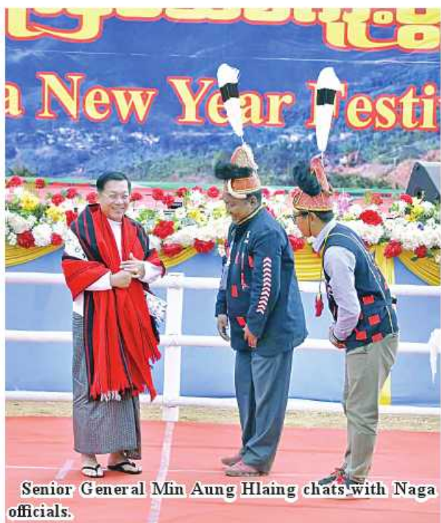
Senior General Min Aung Hlaing chats with Naga officials.

It is heartening to see better road transport of the townships in Naga Self-Administered Zone, and the efforts of relevant departments are praiseworthy. See Page 12