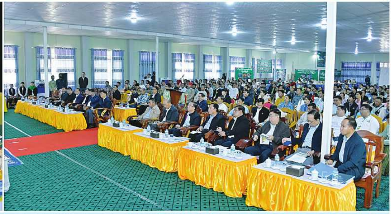
နိုင်ငံတော်စီမံအုပ်ချုပ်ရေးကောင်စီဥက္ကဋ္ဌ နိုင်ငံတော်ဝန်ကြီးချုပ် ဗိုလ်ချုပ်မှူးကြီးမင်းအောင်လှိုင် စစ်ကိုင်းတိုင်းဒေသကြီး ဟုမ္မလင်းခရိုင်အတွင်းရှိ ခရိုင်၊ မြို့နယ်အဆင့် ဌာနဆိုင်ရာတာဝန်ရှိသူများ၊ မြို့မိမြို့ပများ၊ အသေးစား၊ အငယ်စားနှင့် အလတ်စားစီးပွားရေး(MSME)လုပ်ငန်းရှင်များအား တွေ့ဆုံ၍ ဒေသဖွံ့ဖြိုးတိုးတက်ရေးဆိုင်ရာများကို ဆွေးနွေးပြောကြားစဉ်။

နေပြည်တော် စန်နဝါရီ ၁၅ မင်းအောင်လှိုင်သည် ယနေ့နံနက်ပိုင်းတွင် စစ်ကိုင်း များ၊ အသေးစား၊ အငယ်စားနှင့် အလတ်စား ရေးဆိုင်ရာများကို ဆွေးနွေးပြောကြားသည်။ နိုင်ငံတော်စီမံအုပ်ချုပ်ရေးကောင်စီ ဥက္ကဋ္ဌ | တိုင်းဒေသကြီး ဟုမ္မလင်းခရိုင်အတွင်းရှိ ခရိုင်၊ မြို့ စီးပွားရေး(MSME)လုပ်ငန်းရှင်များကို ဟုမ္မလင်း | အဆိုပါတွေ့ဆုံပွဲသို့ နိုင်ငံတော်စီမံအုပ်ချုပ်ရေး နိုင်ငံတော်ဝန်ကြီးချုပ် ဗိုလ်ချုပ်မှူးကြီး နယ်အဆင့် ဌာနဆိုင်ရာတာဝန်ရှိသူများ၊ မြို့မိမြို့ပ မြို့ မြို့တော်ခန်းမ၌တွေ့ဆုံ၍ ဒေသဖွံ့ဖြိုးတိုးတက် ကောင်စီဥက္ကဋ္ဌ စာမျက်နှာ ၁၉ ကော်လံ ၁ ✪