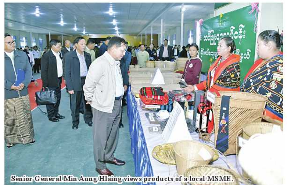
Senior General Min Aung Hlaing views products of a local MSME.

It is necessary to have input, capital, technology and human resources for the success of commodity production enterprises. Although difficulties on fertilizer and power could be overcome in various ways, we, like other countries, are facing surge in prices of fuel oil. Our country has over one million motor vehicles and over six million motorbikes