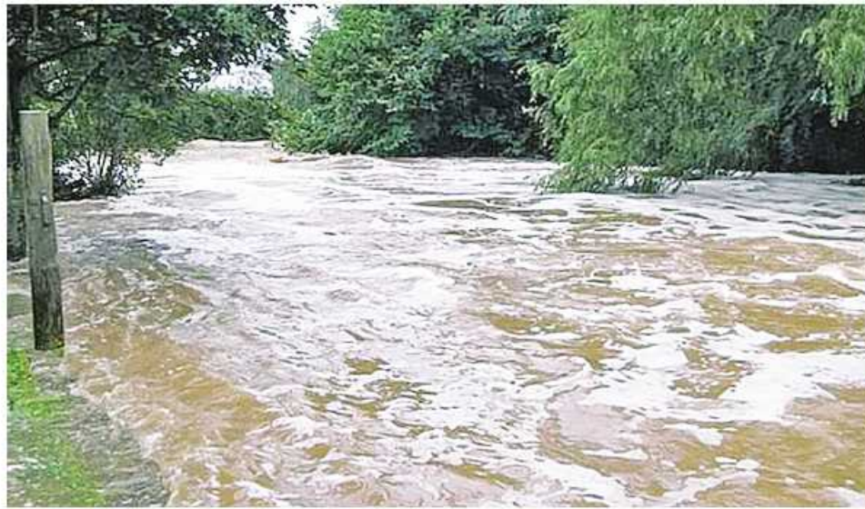
ဟာရဲရား ဇန်နဝါရီ ၁၅

ဇင်ဘာဘွေနိုင်ငံ မန်နီကာလန်း ပြည်နယ်၊ မက်ဗင်ဂိုပြည်နယ်၊ ဟာတာဘီလီလန်းပြည်နယ်၊ ဟာရှီ နာလန်းပြည်နယ်အလယ်ပိုင်းနှင့် မစ်လန်းပြည်နယ်တို့တွင် ဇန်နဝါရီ လပထမပတ်မှစ၍ ရေကြီးရေလျှံမှုကြောင့် ဘေးလွတ်ရာရွှေ့ပြောင်းခဲ့ရသည့် လူဦးရေ သောင်းနှင့်ချီ၍ ရှိနေပြီဖြစ်ကြောင်း ဇင်ဘာဘွေ