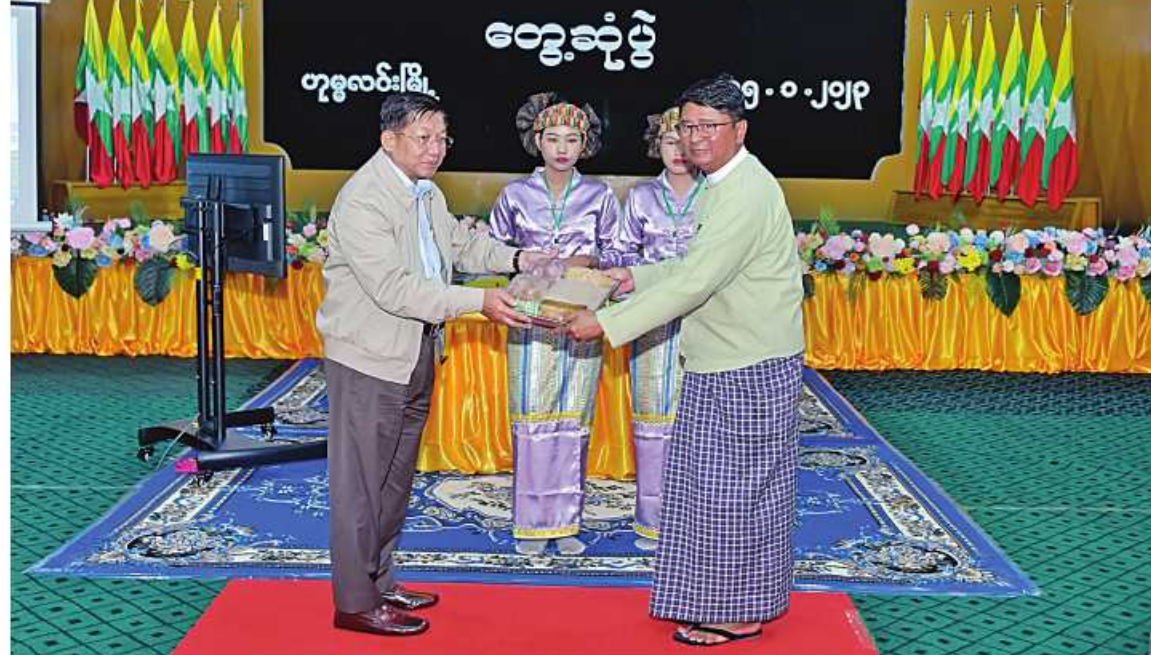
နိုင်ငံတော်စီမံအုပ်ချုပ်ရေးကောင်စီဥက္ကဋ္ဌ နိုင်ငံတော်ဝန်ကြီးချုပ် ဗိုလ်ချုပ်မှူးကြီးမင်းအောင်လှိုင် ခရိုင်၊ မြို့နယ်အဆင့်ဌာနဆိုင်ရာ ဝန်ထမ်းများအတွက် လက်ဆောင်ပစ္စည်းများပေးအပ်စဉ်။

ဆက်လက်ပြီး ဒေသဖွံ့ဖြိုးရေးအတွက် ဆွေးနွေးပြောကြားရာတွင် ဟုမ္မလင်းဒေသသည် ဒေသဖွံ့ဖြိုးတိုးတက်ရေးအတွက် ဆောင်ရွက်နိုင်မည့် အခြေအနေများစွာကို ပိုင်ဆိုင်ထားရှိပြီးဖြစ်ကြောင်း၊ ဒေသတွင်း ဖြစ်ထွန်းသည့် လက်ဖက်၊ ရော်ဘာစိုက်ပျိုးခြင်းများကို အားပေးဆောင်ရွက်ကြရန် လိုကြောင်း၊ ထို့ပြင် ဒေသတွင်း၌ မြေပဲ၊ နှမ်း၊ ဆီမုန်ညင်းတို့လည်း စိုက်ပျိုးကြကြောင်း၊ ဝါးသယံဇာတနှင့် ကြိမ်များလည်း ထွက်ရှိကြောင်း၊ ရွှေအပါအဝင် သဘာဝပေးအပ်ထားသည့် သယံဇာတအရင်းအမြစ်များစွာကြွယ်ဝသည့် ဒေသတစ်ခုလည်းဖြစ်ကြောင်း၊ ရေနံနှင့် သဘာဝဓာတ်ငွေ့များလည်းထွက်ရှိကြောင်း၊ ဒေသဖွံ့ဖြိုးရေးအတွက် အဓိကလိုအပ်သည့် လျှပ်စစ်စွမ်းအား စာမျက်နှာ ၂၀ သို့