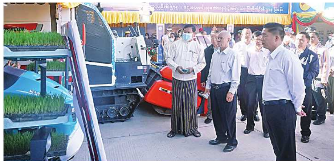
နိုင်ငံတော်စီမံအုပ်ချုပ်ရေးကောင်စီအဖွဲ့ဝင်များနှင့် ပြည်ထောင်စုဝန်ကြီးများ (၇၁)နှစ်မြောက် ကယားပြည်နယ်နေ့အထိမ်းအမှတ်ပြခန်းများကို လှည့်လည်ကြည့်ရှုအားပေးစဉ်။

ထွန်းအောင်မြင့်၊ ကယားပြည်နယ်ဝန်ကြီးချုပ် ဦးလော်မျိုးတင်၊ အရှေ့ပိုင်းတိုင်းစစ်ဌာနချုပ် တိုင်းမှူး ဗိုလ်ချုပ်လှမိုး၊ ဒုတိယဝန်ကြီး ဒေါက်တာအောင်လေး၊ ဒုတိယဝန်ကြီး ဒေါက်တာအေးထွန်းနှင့် တာဝန်ရှိသူများ တက်ရောက်ကြသည်။ ဦးစွာ နိုင်ငံတော်စီမံအုပ်ချုပ်ရေးကောင်စီအဖွဲ့ဝင် စောဒန်းနီယယ်၊ ဦးစိုင်းလုံးဆိုင်၊ ဦးရွှေကြိမ်း၊ ပြည်ထောင်စုဝန်ကြီး ဦးစောထွန်းအောင်မြင့်နှင့် ပြည်နယ်ဝန်ကြီးချုပ် ဦးလော်မျိုးတင်တို့က (၇၁)နှစ်မြောက် ကယားပြည်နယ်နေ့အထိမ်းအမှတ်ပြခန်းပုဒ်ကို ဖဲကြိုးဖြတ်ဖွင့်လှစ်ပေးပြီး ဌာနဆိုင်ရာများ၊ တိုင်းရင်းသားယဉ်ကျေးမှုအဖွဲ့များနှင့်အတူ စုပေါင်းမှတ်တမ်းတင်ဓာတ်ပုံရိုက်ကြကာ ဌာနဆိုင်ရာများ