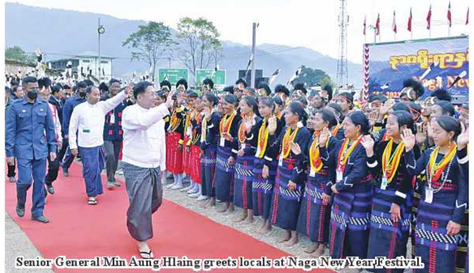
Senior General Min Aung Hlaing greets locals at Naga New Year Festival.

Zone Administration Body. In so doing, they all have to culture the spirit to take responsibilities to do their functions with goodwill. Departmental personnel who serve for all-round devel-