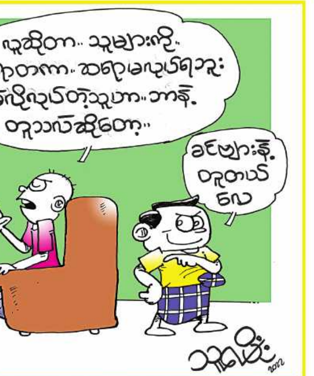
လူဆိုတာ.. သူများကို.. ဝန်ရာတာက.. ဆရာမလုပ်ရသူ.. အဲလိုလုပ်တဲ့သူဟာ.. ဘာနဲ့.. တူသလိုဆိုတော့.. ခင်ဗျားနဲ့ တူတယ် ဧဟ သူမိမိ