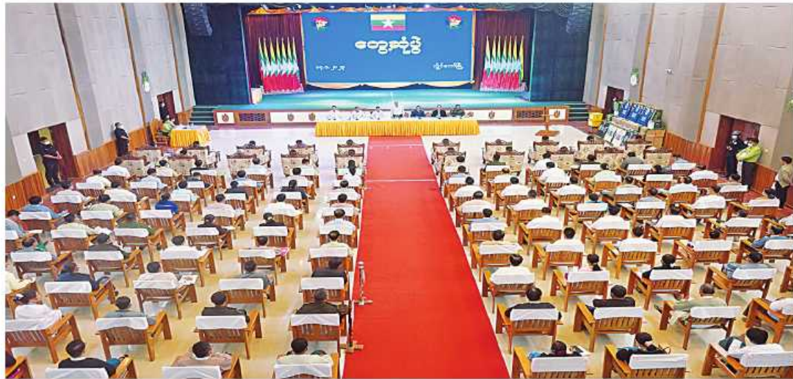
နိုင်ငံတော်စီမံအုပ်ချုပ်ရေးကောင်စီအဖွဲ့ဝင်များနှင့် ပြည်ထောင်စုဝန်ကြီးများ ကယားပြည်နယ်အတွင်းရှိ ဒေသခံပြည်သူများနှင့် တွေ့ဆုံဆွေးနွေးစဉ်။

လွိုင်ကော် ဇန်နဝါရီ ၁၅ နိုင်ငံတော် စီမံအုပ်ချုပ်ရေးကောင်စီ အဖွဲ့ဝင်များနှင့် ပြည်ထောင်စုဝန်ကြီးများသည် ယမန်နေ့ မွန်းလွဲ ၁၂ နာရီခွဲတွင် ကယားပြည်နယ်ခန့်မ၌ ကျင်းပသည့် ဒေသခံပြည်သူများနှင့် တွေ့ဆုံပွဲအခမ်းအနားသို့ တက်ရောက်ကြသည်။ ဦးစွာ နိုင်ငံတော်စီမံအုပ်ချုပ်ရေးကောင်စီ အဖွဲ့ဝင် စောဒန်းနီယယ်၊ ပြည်ထောင်စုဝန်ကြီး ဒုတိယဗိုလ်ချုပ်ကြီးထွန်းထွန်းနောင်နှင့် ဦးစောထွန်းအောင်မြင့်တို့က နိုင်ငံတော် စီမံအုပ်ချုပ်ရေးကောင်စီ၏ ရွေ့လုပ်ငန်းစဉ်(၅)ရပ်နှင့်အညီ နိုင်ငံတော် ဖွံ့ဖြိုးတိုးတက်ရေးနှင့် တည်ငြိမ်ရေးအတွက် နိုင်ငံတော်စီမံအုပ်ချုပ်ရေးကောင်စီက တာဝန်ယူဆောင်ရွက်နေမှုများကို ရှင်းလင်းပြောကြားကြသည်။ ယင်းနောက် နယ်စပ်ရေးရာဝန်ကြီးဌာန ပြည်ထောင်စုဝန်ကြီး ဒုတိယဗိုလ်ချုပ်ကြီး ထွန်းထွန်းနောင်က ဆိုလာပစ္စည်းများကို လည်းကောင်း၊ ကျန်းမာရေးဝန်ကြီးဌာန