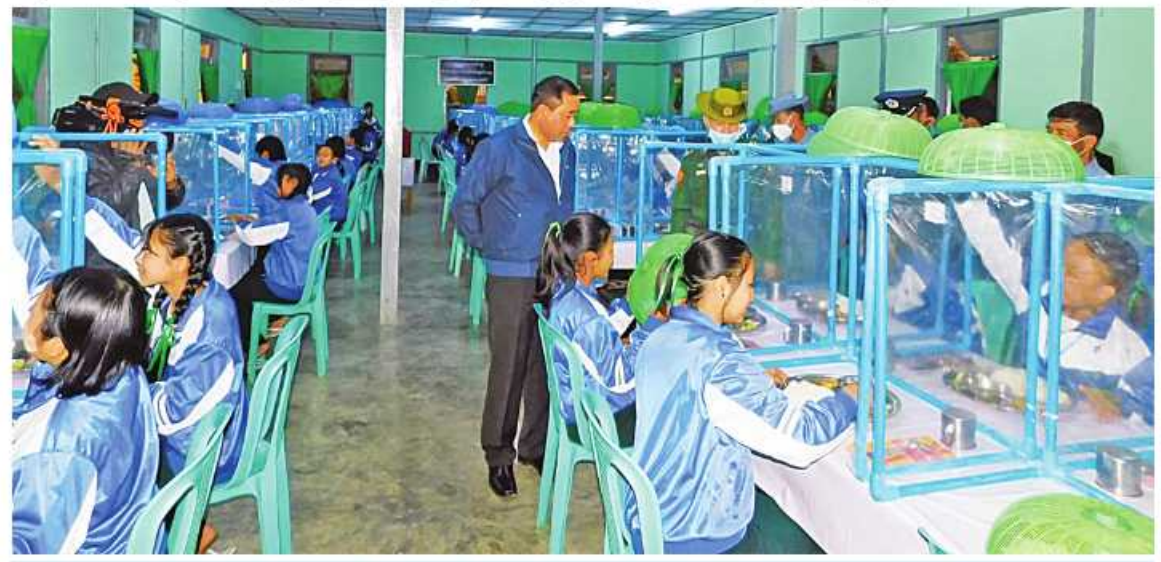
ပြည်ထောင်စုဝန်ကြီး ဒုတိယဗိုလ်ချုပ်ကြီးထွန်းထွန်းနောင် နယ်စပ်ဒေသနှင့် တိုင်းရင်းသားလူငယ်များဖွံ့ဖြိုးရေးသင်တန်းကျောင်း (လွိုင်ကော်)ရှိ စားရိပ်သာအား ကြည့်ရှုစစ်ဆေးစဉ်။

ဆောင်ရွက်ပေးပြီး ကယားပြည်နယ်ဖွံ့ဖြိုးမှု ကြီးကြပ်ရေးရုံး၊ နယ်စပ်ဒေသနှင့် တိုင်းရင်းသားလူငယ်များ ဖွံ့ဖြိုးရေးသင်တန်း ကျောင်းနှင့် အမျိုးသမီးအိမ်တွင်းမှု သက်မွေးလုပ်ငန်းပညာသင်တန်းကျောင်း တို့မှ ဝန်ထမ်းများကို လိုအပ်သည်များ မှာကြား၍ ရုံးဝင်းအတွင်း လိုက်လံကြည့်ရှု စစ်ဆေးသည်။ ဆက်လက်၍ ပြည်ထောင်စုဝန်ကြီးနှင့် အဖွဲ့သည် အမျိုးသမီးအိမ်တွင်းမှု သက်မွေးလုပ်ငန်းပညာသင်တန်းကျောင်း (လွိုင်ကော်)သို့သွားရောက်၍ ကျောင်းဝင်း အတွင်းရှိ သင်တန်းခန်းမများ၊ သင်တန်းသူ များ၏ လေ့ကျင့်သင်ကြားနေမှုများ၊ အိမ်ဆောင်များ၊ စားရိပ်သာများအား ကြည့်ရှုစစ်ဆေးပြီး လိုအပ်သည်များ ပြည့်ဆည်းဆောင်ရွက်ပေးသည်။ ပြည်ထောင်စုဝန်ကြီးနှင့် အဖွဲ့သည်