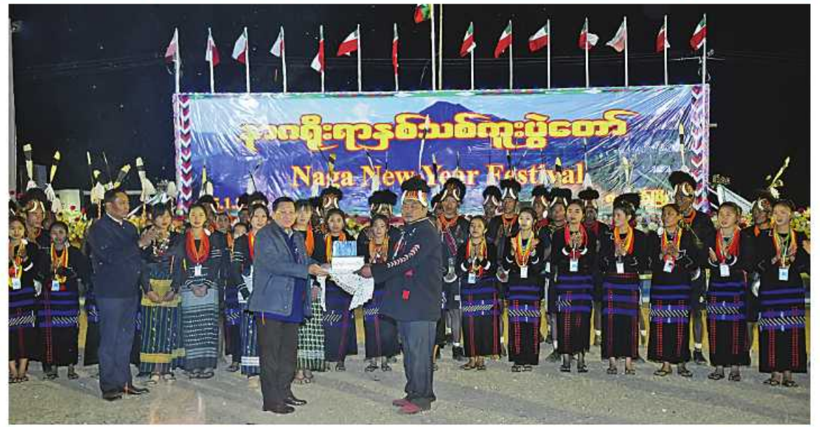
နိုင်ငံတော်စီမံအုပ်ချုပ်ရေးကောင်စီဥက္ကဋ္ဌ နိုင်ငံတော်ဝန်ကြီးချုပ် ဝိုလ်ချုပ်မှူးကြီးမင်းအောင်လှိုင် နာဂမျိုးနွယ်ရအကအဖွဲ့ များကို ဂုဏ်ပြုချီးမြှင့်ငွေများ ပေးအပ်ချီးမြှင့်စဉ်။

အကောင်အထည်ဖော် ဆောင်ရွက်သွားကြ ရမည်ဖြစ်ပါကြောင်း။ နာဂကိုယ်ပိုင်အုပ်ချုပ်ခွင့်ရဒေသ မြို့နယ် များ၏ လမ်းပန်းဆက်သွယ်ရေးသည် ယခင်ကထက်ပိုမိုကောင်းမွန်ပြီး မြို့ရွာများ ဖွံ့ဖြိုးတိုးတက်နေကြောင်း သိရှိရသည့် အတွက် သက်ဆိုင်ရာဌာနများ၏ ကြိုးပမ်း အားထုတ်မှုကို အသိအမှတ်ပြုဂုဏ်ပြုပါ ကြောင်း၊ မိမိတို့အစိုးရအဖွဲ့အနေဖြင့် နာဂဒေသ၏ လမ်းပန်းဆက်သွယ်ရေး အပါအဝင် ကဏ္ဍအားလုံးကို ယခုထက် ပိုမိုမြှင့်တင်နိုင်ရေး ဆောင်ရွက်ပေးသွား မည်ဖြစ်ပါကြောင်း၊ အထူးသဖြင့် နာဂ တိုင်းရင်းသားများ၏ ပညာရေးကဏ္ဍ၊ လမ်းပန်းဆက်သွယ်မှုကဏ္ဍနှင့် ကျန်းမာရေး ကဏ္ဍများ အချိုးညီညီဖွံ့ဖြိုးတိုးတက်နိုင် စေရေး ကြိုးပမ်းဆောင်ရွက်ပေးသွားမည် ဖြစ်ပါကြောင်း။