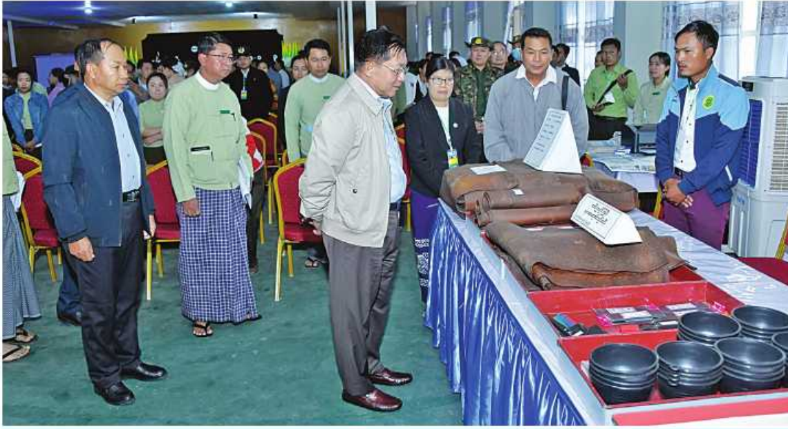
နိုင်ငံတော်စီမံအုပ်ချုပ်ရေးကောင်စီဥက္ကဋ္ဌ နိုင်ငံတော်ဝန်ကြီးချုပ် ဗိုလ်ချုပ်မှူးကြီးမင်းအောင်လှိုင် သယ်စာတတွင်းထွက်ထုတ်ကုန်များ၊ စားသောက်ကုန်၊ လူသုံးကုန်၊ စက်မှုလက်မှုထုတ်ကုန်၊ ရိုးရာလက်မှုထုတ်ကုန်များ၊ အဝတ်အထည်များ၊ တိုင်းရင်းဆေးများ စသည်ထုတ်ကုန်ပစ္စည်းများ ခင်းကျင်းပြသထားရှိမှုများကို ပြကွက်တစ်ခုချင်းစီအလိုက် စိတ်ဝင်တစားလေ့လာစဉ်။

စိုက်ပျိုးရေးလုပ်ငန်းများအတွက်လိုအပ် သည့် သုံးစရံရရှိရေးကိုလည်း ချင်းတွင်း မြစ်မှ မြစ်ရေတင်လုပ်ငန်းများဖြင့်ဆောင် ရွက်၍ ရနိုင်မည်ဖြစ်ကြောင်း၊ စိုက်ပျိုးရေး