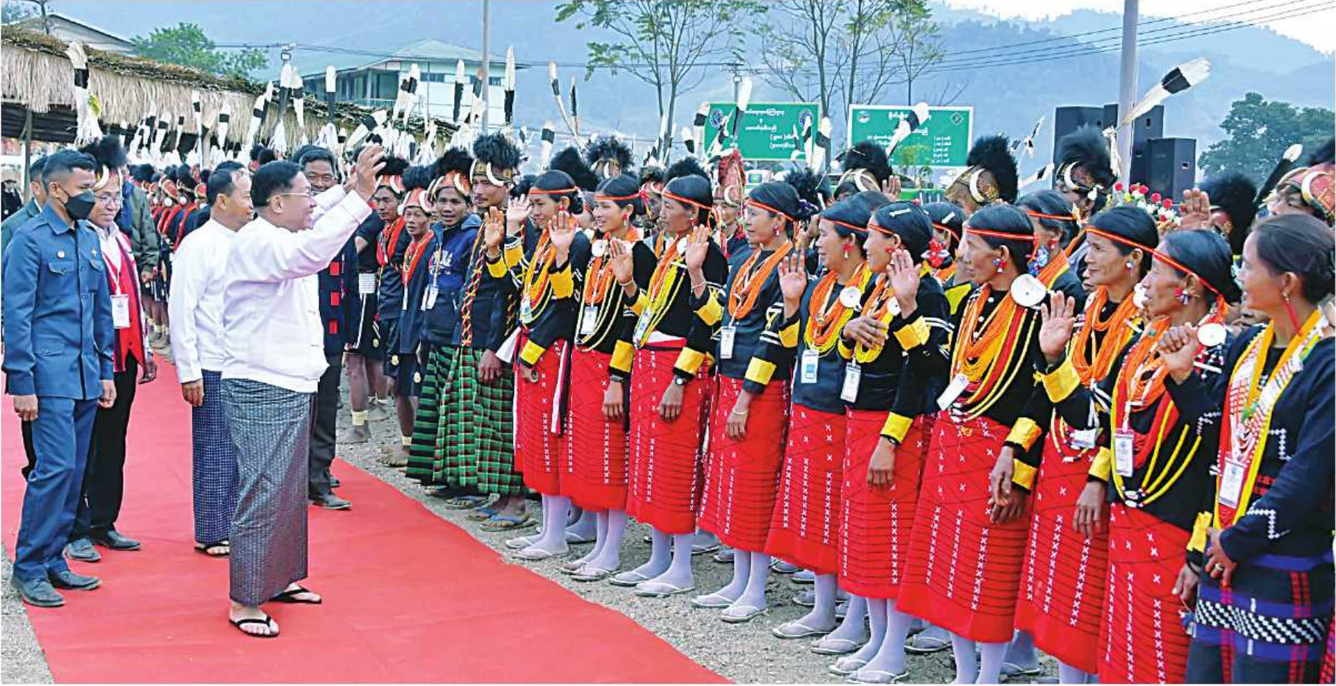
နိုင်ငံတော်စီမံအုပ်ချုပ်ရေးကောင်စီဥက္ကဋ္ဌ နိုင်ငံတော်ဝန်ကြီးချုပ် ဗိုလ်ချုပ်မှူးကြီးမင်းအောင်လှိုင် ရိုးရာအကအလှအဖွဲ့များနှင့် ဒေသခံတိုင်းရင်းသားများကို ရင်းနှီးနှေးနှေးစွာနှုတ်ဆက်စဉ်။

နေပြည်တော် ၈နိုဝင်ဘာ ၁၅ ဒေသ လဟယ်မြို့၌ ကျင်းပပြုလုပ်ရာ နိုင်ငံတော် ချီးမြှင့်သည်။ အခမ်းအနားကျင်းပမည့် လဟယ်မြို့သို့ ရောက်ရှိ နာဂရိုးရာနှစ်သစ်ကူးပွဲတော်အခမ်းအနားကို စီမံအုပ်ချုပ်ရေးကောင်စီဥက္ကဋ္ဌ နိုင်ငံတော်ဝန်ကြီးချုပ် ဦးစွာ နိုင်ငံတော်စီမံအုပ်ချုပ်ရေးကောင်စီ ကြရာ အနောက်မြောက်တိုင်းစစ်ဌာနချုပ် တိုင်းမှူး ယနေ့မွန်းလွဲပိုင်းတွင် နာဂကိုယ်ပိုင်အုပ်ချုပ်ခွင့်ရ ဗိုလ်ချုပ်မှူးကြီးမင်းအောင်လှိုင် တက်ရောက် ဥက္ကဋ္ဌ နိုင်ငံတော်ဝန်ကြီးချုပ်နှင့် အဖွဲ့ဝင်များသည် ဗိုလ်ချုပ်သန်းထိုက်၊ စာမျက်နှာ ၁၆ ကော်လံ ၁၂၈