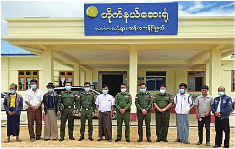
တပ်မတော်သား ဆရာဝန်များက စစ်ကိုင်းတိုင်းဒေသကြီး၊ ချင်းပြည်နယ်နှင့် နာဂကိုယ်ပိုင်အုပ်ချုပ်ခွင့်ရ ဒေသများမှ ကျန်းမာရေးဝန်ထမ်းများ နှင့်အတူ အမှတ်တရ ရပေါင်းစာတံပုံရိုက်စဉ်။

အပြည့်အဝပေးနိုင်ရေးအတွက် လိုအပ်သည့် ဆေးနှင့်ဆေးပစ္စည်းများ၊ အုပ်ချုပ် ထောက်ပံ့မှုပစ္စည်းများ၊ ကိုဗစ်-၁၉ ရောဂါ ကာကွယ်ကုသရေးပစ္စည်းများကိုထောက်ပံ့ ပေးခဲ့သည့်အတွက် ယခုကဲ့သို့ မိမိတို့၏ တာဝန်ဝတ္တရားများကို အောင်မြင်စွာ ထမ်းဆောင်နိုင်ခဲ့ခြင်း ဖြစ်ပါကြောင်း၊ နိုင်ငံတော် စီမံအုပ်ချုပ်ရေးကောင်စီဥက္ကဋ္ဌ တပ်မတော်ကာကွယ်ရေးဦးစီးချုပ်၏ လမ်းညွှန် မှုဖြင့် နယ်မြေခံပြည်သူလူထု၏ ကျန်းမာရေး အဆင့်အတန်း မြင့်မားလာစေရေးအတွက် သာမက ပြည်သူ့အကျိုးပြုလုပ်ငန်းများ၊ ဒေသဘက်စုံတိုးတက်ရေးလုပ်ငန်းများနှင့်