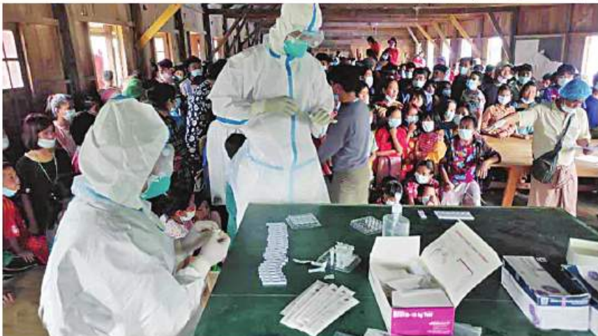
တပ်မတော်သားဆရာဝန်များက စစ်ကိုင်းတိုင်းဒေသကြီး၊ ချင်းပြည်နယ်နှင့် နာဂကိုယ်ပိုင်အုပ်ချုပ်ခွင့်ရဒေသများမှ ဒေသခံပြည်သူများကို ကျန်းမာရေးစောင့်ရှောက်မှု လုပ်ငန်းများ ဆောင်ရွက်ပေးစဉ်။

တပ်မတော်သားဆရာဝန်များ အနေ ဖြင့် စတင်တာဝန်ထမ်းဆောင်ချိန်မှစ၍ တတိယအကြိမ်အထိ ဒေသခံတိုင်းရင်းသား ပြည်သူ စုစုပေါင်း ၄၆၇၀၀၆ ဦးတို့ကို ကျန်းမာရေးဆိုင်ရာ ပြုစုစောင့်ရှောက်မှု များ ဆောင်ရွက်ပေးနိုင်ခဲ့ကြောင်းနှင့် ဒေသခံပြည်သူတို့၏ ကျန်းမာရေးစောင့် ရှောက်မှုလုပ်ငန်းများအပြင် ပြည်သူ့ အကျိုးပြုလုပ်ငန်းများ၊ စားဝတ်နေရေး အထောက်အကူဖြစ်စေရန် စိုက်ပျိုးရေးမြူ ရေးဆိုင်ရာ အသိပညာပေးခြင်းများ၊ ဒေသ ဘက်စုံတိုးတက်ရေးလုပ်ငန်းများတွင်လည်း ဒေသခံပြည်သူများ၊ ဌာနဆိုင်ရာဝန်ထမ်း များနှင့်အတူ ဝိုင်းဝန်းကူညီဆောင်ရွက် ပေးနိုင်ခဲ့ပြီး မိမိတို့တတ်မြောက်ထားသည့် ပညာရပ်များဖြင့် ဒေသခံပြည်သူတို့၏ အကျိုး၊ နိုင်ငံတော်အကျိုးကို တတ်စွမ်း သရွေ့ သယ်ပိုးထမ်းရွက်နိုင်ခဲ့ကြသဖြင့် ယခုကဲ့သို့ အခမ်းအနားဖြင့် ဂုဏ်ပြုခဲ့ခြင်း ဖြစ်ကြောင်း သတင်းရရှိသည်။