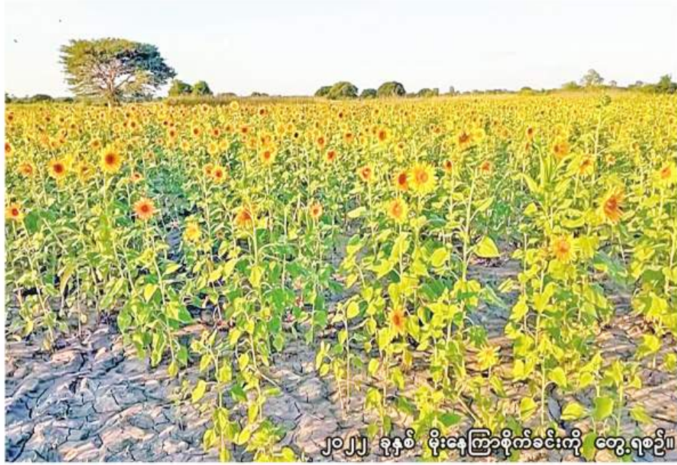
၂၀၂၂ ခုနှစ် မိုးဇူလိုင်လအတွင်းက ဇူလိုင်လအတွင်း