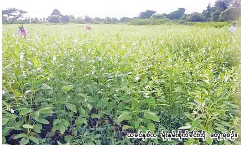
ယခင်နှစ်က မိုးရမ်းစိုက်ခင်းကို တွေ့ရစဉ်။