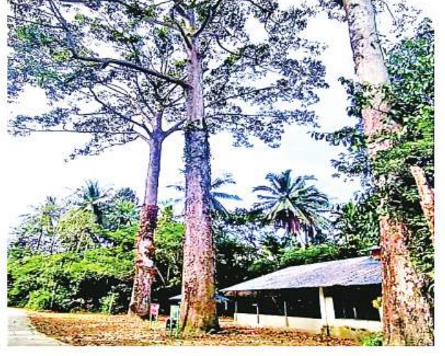
ခိုင်းဆက်

27 ညီလာခံမှာကတည်းက ကျွန်တော် ကတိပေးပြောကြားထားတဲ့ အတိုင်း COP ညီလာခံကို ဘရာဇီးနိုင်ငံရဲ့ အမေရိကန်သစ်တောကြီးပိုင်းအနီးမှာ ကျင်းပသွားနိုင်ဖို့အတွက် တရားဝင်ကမ်းလှမ်းမှု ပြုလုပ်ထားပြီးဖြစ်ပါတယ်”ဟု သမ္မတလူလာဒါဆေးလ်ဗားက ပြောကြားခဲ့သည်။ တရားဝင်ကမ်းလှမ်းမှုကို ဘရာဇီးနိုင်ငံခြားရေးဝန်ကြီး မော်ရီဗီအဲရာက ဦးဆောင်ပြုလုပ်ခဲ့ခြင်းဖြစ်ပြီး ကုလသမဂ္ဂအဖွဲ့အစည်းအနေဖြင့် ဘရာဇီးနိုင်ငံ၏ ကမ်းလှမ်းမှုကို လက်ခံမည်ဟု ဘရာဇီးအစိုးရက ယုံကြည်မျှော်လင့်နေကြောင်း