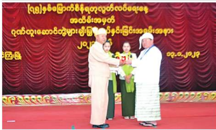
ရှမ်းပြည်နယ်ဝန်ကြီးချုပ် ဒေါက်တာကျော်ထွန်း ဝဏ္ဏကျော်ထင်ဂုဏ်ထူးဆောင်ဘွဲ့ ရရှိသူ ရှမ်းပြည်နယ်မြန်လည်ဖွံ့ဖြိုးတိုးတက်ရေးပါတီ(RCSS/SSA)ဥက္ကဋ္ဌ ဦးယွက်စစ် ကိုယ်စား ဦးစိုင်းရှောင်းဟန်အား ဂုဏ်ထူးဆောင်ဘွဲ့ ချီးမြှင့်အပ်နှင်းစဉ်။