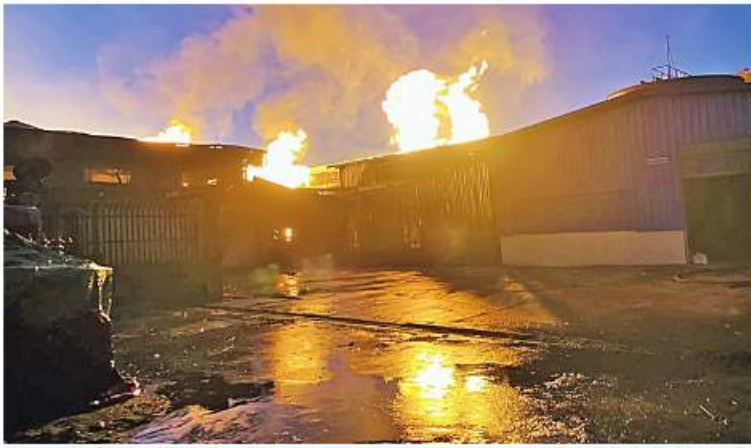
မော်ဘိုမြို့နယ်ရှိ လိပျှတ်ကျေးရွာရှိ Grand Royal အရက်ချက်စက်ရုံ မီးလောင်မှုကို တွေ့ရစဉ်

Tank သုံးလုံး၊ RF 50% အရက်ဆီလီတာ ၂၀၀၀၀ ဆုံ Tank ခြောက်လုံးနှင့် ပိုဒေါင် သုံးလုံးတို့ မီးလောင်ကျွမ်းလျက်ရှိပြီး မီးလောင်ကျွမ်းမှုကို မီးသတ်တပ်ဖွဲ့ဝင်များက စွမ်းစွမ်းတမ်းတမ်း မီးငြိမ်းသတ် ဆောင်ရွက်လျက်ရှိ၍ ညနေ ၅ နာရီခွဲတွင် အဆိုပါ စက်ရုံအတွင်းမှ ပေါက်ကွဲမှုဖြစ်ပွားခဲ့သဖြင့် မီးငြိမ်းသတ်နေသည့် မီးသတ်တပ်ဖွဲ့ဝင် ၁၂ ဦးတို့တွင် ဒဏ်ရာအချို့ရရှိခဲ့သောကြောင့် အင်းစိန်ပြည်သူ့ဆေးရုံကြီးသို့ ပို့ဆောင်ဆေးဝါးကုသမှု ခံယူလျက်ရှိသည်။ စက်ရုံမီးလောင်ကျွမ်းရသည့်အကြောင်းရင်းနှင့် ဆုံးရှုံးမှုတန်ဖိုးကို စိစစ်ထွက်ချက်လျက်ရှိကာ မီးလောင်ကျွမ်းမှုကို အမြန်ဆုံး ငြိမ်းသတ်နိုင်ရေးအတွက် မီးသတ်တပ်ဖွဲ့ဝင်များက ဆက်လက်ကြိုးပမ်းငြိမ်းသတ်ဆောင်ရွက်လျက်ရှိကြောင်း သတင်းရရှိသည်။