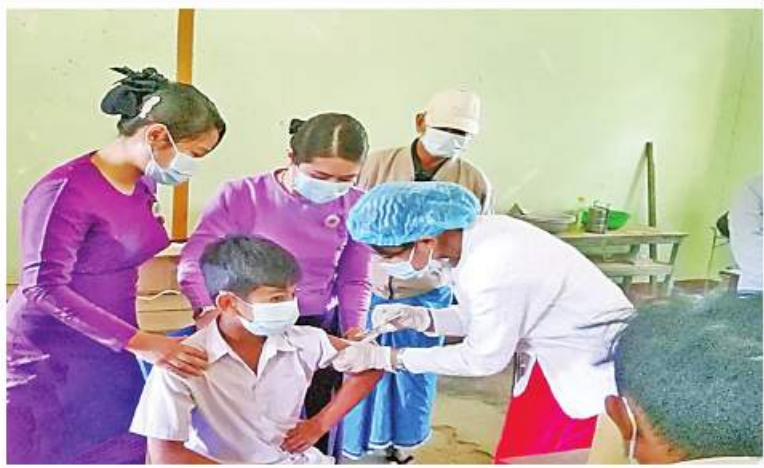
မန္တလေးတိုင်းဒေသကြီး မြင်းခြံမြို့နယ်အတွင်းရှိ ကျောင်းသား၊ ကျောင်းသူများကို ကိုဗစ်-၁၉ ရောဂါ ကာကွယ်ဆေး ထိုးနှံပေးစဉ်