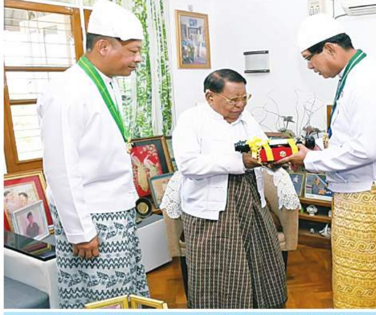
ရန်ကုန်တိုင်းဒေသကြီးဝန်ကြီးချုပ် ဦးစိုးသိန်းနှင့် ရန်ကုန်တိုင်းစစ်ဌာနချုပ် တိုင်းမှူး ဗိုလ်ချုပ်ညွန့်ဝင်းဆွေတို့က ဝဏ္ဏကျော်ထင်ဘွဲ့ရရှိသူ ပို့ဆောင်ရေးဝန်ကြီးဌာန ဒုတိယဝန်ကြီး ဦးစန်းဝေ(ငြိမ်း)ထံ ဂုဏ်ထူးဆောင်ဘွဲ့ လက်ရောက်ချီးမြှင့် အပ်နှင်းစဉ်။