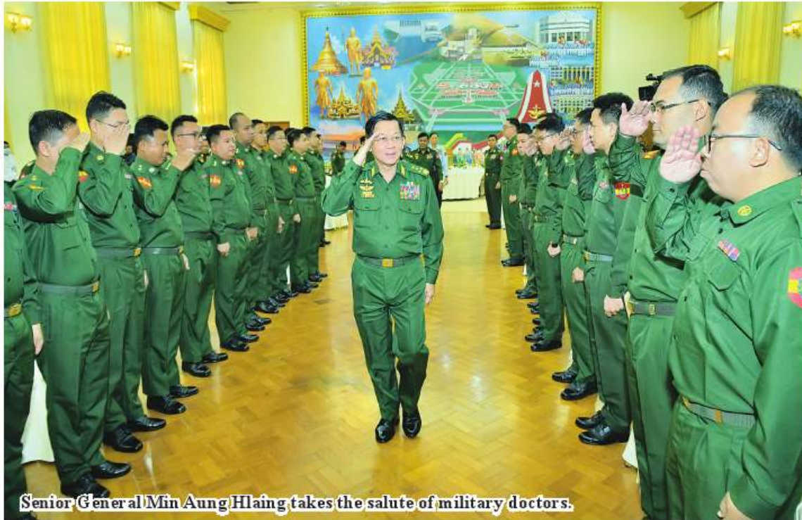
Senior General Min Aung Hlaing takes the salute of military doctors.

Nay Pyi Taw January 13 A ceremony to honour military doctors who served at physician-insufficient hospitals in transport-poor far-flung corners of Naga Self-Administered Zone, Chin State and Sagaing Region to improve the health conditions of locals was held at Bayintnaung Villa this morning with an address by Chairman of State Administration Council Commander-in-Chief of Defence Services Senior General Min Aung Hlaing.