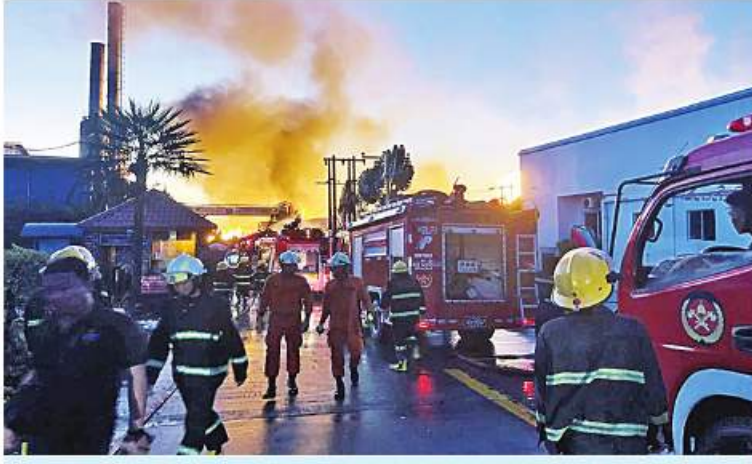
မော်ဘိုမြို့နယ် လိပျှတ်ကျေးရွာရှိ Grand Royal အရက်ချက်စက်ရုံ မီးလောင်မှုကို မြန်မာနိုင်ငံမီးသတ်တပ်ဖွဲ့ဝင်များက မီးငြိမ်းသတ်ဆောင်ရွက်ခဲ့ခြင်း