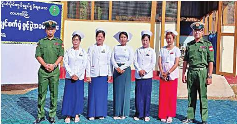
တပ်မတော်သားဆရာဝန်များက စစ်ကိုင်းတိုင်းဒေသကြီး၊ ချင်းပြည်နယ်နှင့် နာဂ ကိုယ်ပိုင်အုပ်ချုပ်ခွင့်ရဒေသများမှ ကျန်းမာရေးဝန်ထမ်းများနှင့်အတူ အမှတ်တရ ရပေါင်းစာတံပုံရိုက်စဉ်။