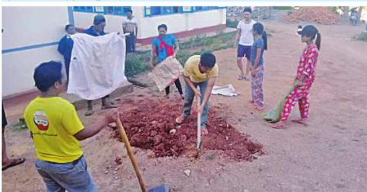
စစ်ကိုင်းတိုင်းဒေသကြီး၊ ချင်းပြည်နယ်နှင့် နာဂကိုယ်ပိုင်အုပ်ချုပ်ခွင့်ရဒေသသို့ တိုးတက်ရေးလုပ်ငန်းများနှင့် ပြည်သူ့အကျိုးပြုလုပ်ငန်းများ ကူညီဆောင်ရွက်ပေးစဉ်။