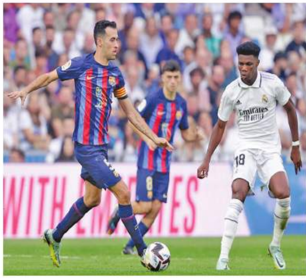
အသင်းက ၁၈ ကြိမ်နိုင်၊ ၁၀ ပွဲများတွင် ရိုးရဲလ်မက်ဒရစ်အသင်း သရေ ၁၆ ပွဲ ရှုံးရလဒ်ထွက်ပေါ်ခဲ့ ကသာ အသာရထားကြောင်း သော်လည်း စပိန်ဂိုဏ်းပွဲစဉ် သိရသည်။ ML

လိုနာအသင်းက လေးဂိုး နှစ်ဂိုးဖြင့် အနိုင်ရခဲ့ပြီး ပိုလ်လွဲသို့ တက်ရောက်နိုင်ခဲ့ကြောင်း သိရသည်။ ထို့ကြောင့် ဘာစီလိုနာအသင်းသည် အခြားဆီမီးဖိုင်နယ်ပွဲစဉ်မှ ဗလင်စီယာအသင်းကို ပင်နယ်တီ အဆုံးအဖြတ်ဖြင့် အနိုင်ရခဲ့သည့် ရိုးရဲလ်မက်ဒရစ်အသင်းနှင့် ပိုလ်လွဲတွင် ထိပ်တိုက်တွေ့ဆုံခဲ့ပြီး အဆိုပါပွဲစဉ်ကို ဇန်နဝါရီ ၁၆ ရက်တွင် ဆော်ဒီအာရေဗျနိုင်ငံတွင် ဆက်လက်ကျင်းပသွားမည် ဖြစ်သည်။ ဘာစီလိုနာအသင်းနှင့် ရိုးရဲလ်မက်ဒရစ်အသင်းတို့သည် အစဉ်အလာရ ပြိုင်ဘက်ကောင်းများဖြစ်ပြီး သမိုင်းတစ်လျှောက် ထိပ်တိုက်တွေ့ဆုံမှု ၃၄ ကြိမ်တွင် ဘာစီလိုနာ