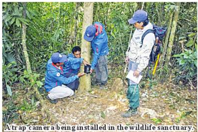
A trap camera being installed in the wildlife sanctuary.