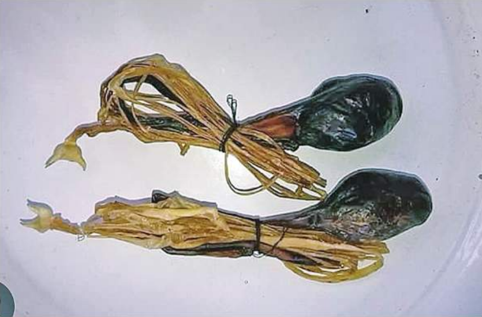
ဆေးဖက်ဝင် စပါးကြီးသည်းခြေကို တွေ့ရစဉ်။

မေး ။ ဆရာကြီးစင်ဗျား ကျွန်တော့် အသက် ၁၀ နှစ်ပါ။ မျက်နှာမှာဝက်ခြံတွေ အများကြီးထွက်လိုပါ။ ဝက်ခြံကို ထုံး တိုပြီး ညှစ်ရမယ်ဆိုလို့ ညှစ်လိုက်တဲ့ အခါ အမည်းစက်တွေကျန်ခဲ့ပါတယ်။