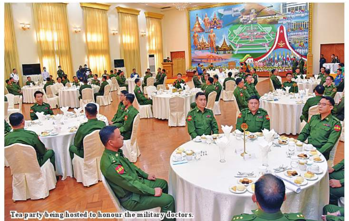
Tea party being hosted to honour the military doctors.

It can be seen that the pandemic has an impact at home and abroad and human resources for healthcare services have decreased. The World Health Organization has set the minimum ratio of people and doctors at 1,000: 1 and the minimum ratio of people and health workers at 1,000: 2.3. In Myanmar, the current ratio of the people and doctors, health workers stands at 1,000: 0.37: 1.47 and the ratio is much lower than the rate designated by the WHO. During the recent political conflict, some health workers deserted their workplaces and See Page 13