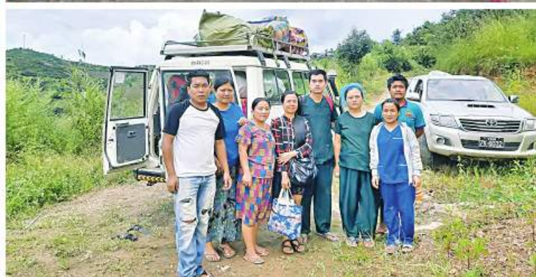
သွားရောက်တာဝန်ထမ်းဆောင်သည့် တပ်မတော်သားဆရာဝန်များက ဒေသဖွံ့ဖြိုး