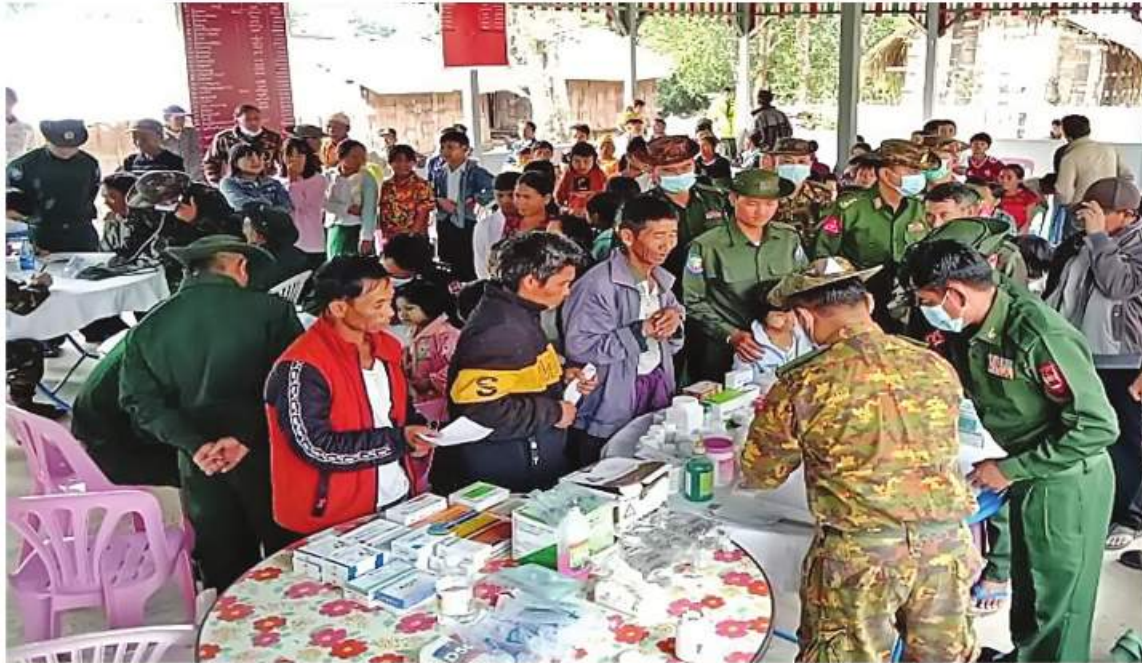
ရမ်းပြည်နယ်(အရှေ့ပိုင်း) မိုင်းဆတ်ခရိုင် မိုင်းဆတ်မြို့နယ် လွယ်ဆောင်ကျေးရွာရှိ ဒေသခံတိုင်းရင်းသားပြည်သူများကို ကြိုတင်ဒေသတိုင်းစစ်ဌာနချုပ် နယ်မြေခံဆေးအဖွဲ့က ကျန်းမာရေးစောင့်ရှောက်မှုလုပ်ငန်းများ ဆောင်ရွက်ပေးစဉ်။

နေပြည်တော် ဒီဇင်ဘာ ၃၀ - ရမ်းပြည်နယ်(အရှေ့ပိုင်း) မိုင်းဆတ် ခရိုင် မိုင်းဆတ်မြို့နယ် လွယ်ဆောင်ကျေးရွာ ရှိ ဒေသခံတိုင်းရင်းသားပြည်သူ ၁၆၄ ဦးကို ယနေ့နံနက်ပိုင်းတွင် ကြိုတင်ဒေသတိုင်း စစ်ဌာနချုပ် နယ်မြေခံဆေးအဖွဲ့က အဆိုပါကျေးရွာ၌ ကျန်းမာရေး စောင့်ရှောက်မှုလုပ်ငန်းများ ဆောင်ရွက် ပေးသည်။ ထိုသို့ဆောင်ရွက်ပေးရာတွင် နား၊ နှာခေါင်း၊ လည်ချောင်းရောဂါ၊ သွေးတိုး ရောဂါ၊ ဝမ်းပျက်ဝမ်းလျှောရောဂါ၊ ငှက်ဖျားရောဂါ၊ အထွေထွေရောဂါ တို့နှင့်ပတ်သက်၍ လိုအပ်သည့် ဆေးဝါး ကုသမှုများ ဆောင်ရွက်ပေးသည်။ ယင်းသို့ ဆောင်ရွက်ပေးနေမှုများကို တိုင်းစစ်ဌာနချုပ်မှ တာဝန်ရှိသူများက သွားရောက်ကြည့်ရှု အားပေးပြီး ဒေသခံတိုင်းရင်းသား ပြည်သူများကို ရင်းရင်းနှီးနှီး လိုက်လံနှုတ်ဆက်ခဲ့ကြောင်း သတင်းရရှိသည်။