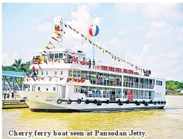
Cherry ferry boat seen at Pansodan Jetty.