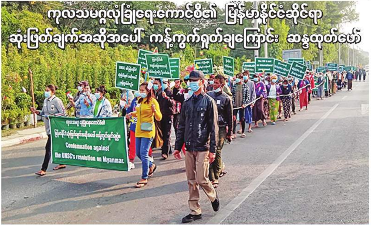
မန္တလေးတိုင်းဒေသကြီး အောင်မြေသာမဖြူနယ်၌ ကုလသမဂ္ဂလုံခြုံရေးကောင်စီ၏ မြန်မာနိုင်ငံဆိုင်ရာ ဆုံးဖြတ်ချက်အဆိုအပေါ် ကန့်ကွက်ရှုတ်ချကြောင်း ဆန္ဒထုတ်ဖော်ပွဲပြုလုပ်စဉ်။ နေပြည်တော် ဒီဇင်ဘာ ၃၀ ၌ မြန်မာနိုင်ငံဆိုင်ရာ လုံခြုံရေးကောင်စီ၏ မြန်မာနိုင်ငံဆိုင်ရာ ဆုံးဖြတ်ချက်အဆိုနှင့် အမေရိကန်ပြည်ထောင်စု နယူးယောက် ဆုံးဖြတ်ချက်အဆိုတစ်ရပ်ကို မဲခွဲချမှတ်ခဲ့ ပတ်သက်၍ ကန့်ကွက်ရှုတ်ချဆန္ဒထုတ်ဖော် ပြု၍ ဒီဇင်ဘာ ၂၁ ရက်တွင် ကျင်းပခဲ့သည့် ကြောင်း သိရသည်။ ပွဲကို ယနေ့နံနက်ပိုင်းတွင် မန္တလေးတိုင်း ကုလသမဂ္ဂလုံခြုံရေးကောင်စီအစည်းအဝေး အဆိုပါကုလသမဂ္ဂလုံခြုံရေးကောင်စီ၏ ဒေသကြီး စာမျက်နှာ ၁၈ ကော်လံ ၄ ☆

ပြည်ထောင်စုသမ္မတမြန်မာနိုင်ငံတော် ကိုဗစ်-၁၉ ကာကွယ်၊ ထိန်းချုပ်၊ ကုသရေးကော်မတီမှ အသိပေးကြေညာချက် ၁၃၈၄ ခုနှစ်၊ ပြာသိုလဆန်း ၉ ရက် (၂၀၂၂ ခုနှစ်၊ ဒီဇင်ဘာလ ၃၀ ရက်) ကိုဗစ်-၁၉ ရောဂါပိုးကူးစက်ပျံ့နှံ့မှုကို ဆက်လက်ထိန်းချုပ်ဆောင်ရွက်ရန်လိုအပ်ပါသဖြင့် ပြည်ထောင်စုအဆင့်အဖွဲ့အစည်းများ၊ ပြည်ထောင်စုဝန်ကြီးဌာနများမှ ကိုဗစ်-၁၉ ရောဂါကာကွယ်၊ ထိန်းချုပ်၊ တားဆီးရေးအတွက် ၂၀၂၂ ခုနှစ် ဒီဇင်ဘာ ၃၁ ရက်ထိ ထုတ်ပြန်ထားသော ပြည်သူ့သို့ ပန်ကြားချက်၊ အမိန့်၊ အမိန့်ကြော်ငြာစာ၊ ညွှန်ကြားချက်များ (ဖြေလျှော့ပေးမည့်ကိစ္စရပ်များမပါ)ကို ၂၀၂၃ ခုနှစ် ဇန်နဝါရီ ၃၁ ရက်ထိ ရက်တိုးမြှင့်သတ်မှတ်ဆောင်ရွက်ထားပါကြောင်း အသိပေးကြေညာအပ်ပါသည်။