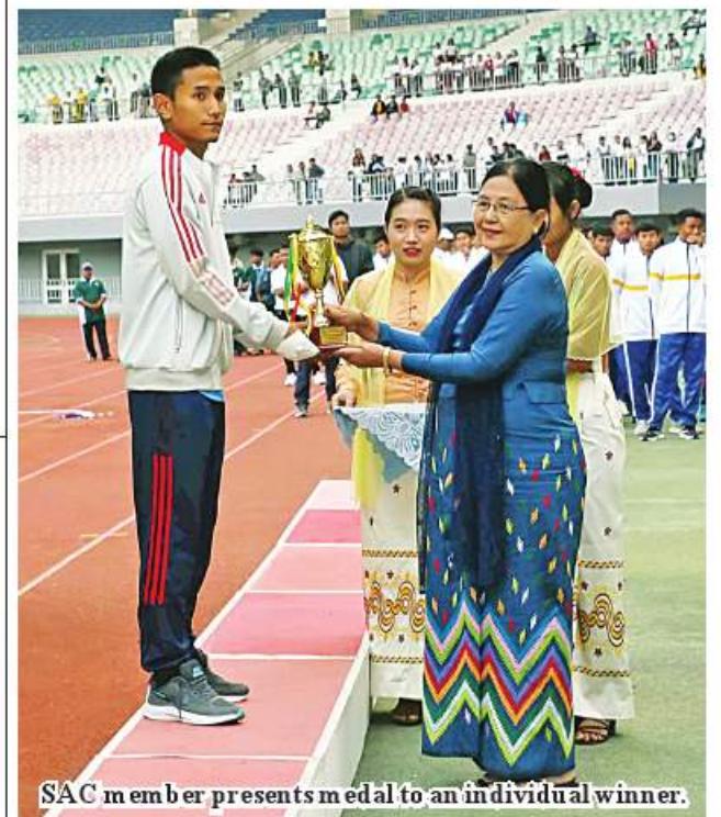
SAC member presents medal to an individual winner.