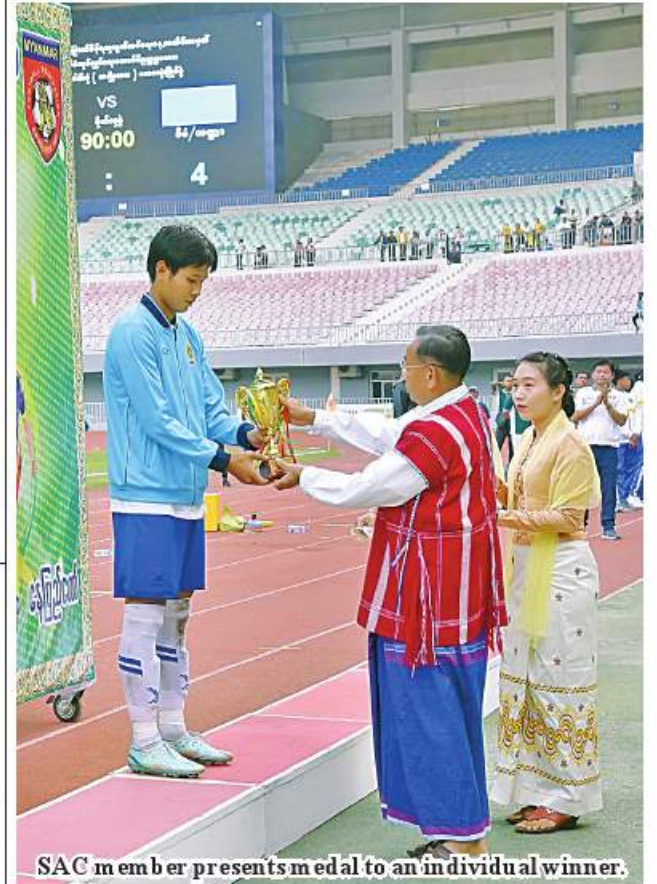
SAC member presents medal to an individual winner.