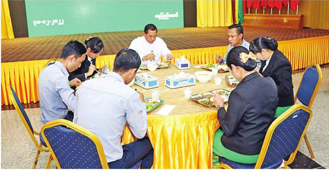
နယ်စပ်ရေးရာဝန်ကြီးဌာန ပြည်ထောင်စုဝန်ကြီး ဒုတိယဗိုလ်ချုပ်ကြီးထွန်းထွန်းနောင် ဝန်ထမ်းများနှင့် မိတ်ဆုံနေ့လယ်စာကို လက်ရည်တစ်ပြင်တည်းသုံးဆောင်စဉ်။

နေပြည်တော် ဒီဇင်ဘာ ၃၀ နိုင်ငံတော်အစိုးရ၏ ယန္တရားကောင်းမွန်စွာ လည်ပတ်နိုင်ရေးအတွက် ကျရာကဏ္ဍမှ တာဝန်ကျေပွန်စွာ ထမ်းဆောင်နေကြသော ဝန်ထမ်းများကို မိသားစုသဖွယ်အသိအမှတ်ပြုသောအားဖြင့် မိတ်ဆုံနေ့လယ်စာစားပွဲများ လစဉ်ကျင်းပပေးလျက်ရှိရာ ယနေ့ မွန်းတည့် ၁၂ နာရီတွင် နယ်စပ်ရေးရာဝန်ကြီးဌာန၏ တတိယအကြိမ် မိတ်ဆုံစားပွဲကို အဆိုပါဝန်ကြီးရုံး၌ ကျင်းပသည်။ ရွေးဦးစွာ ပြည်ထောင်စုဝန်ကြီး ဒုတိယဗိုလ်ချုပ်ကြီးထွန်းထွန်းနောင်က နိုင်ငံတော်၏ ဖွံ့ဖြိုးရေးလုပ်ငန်းများ အကောင်အထည်ဖော်ဆောင်ရွက်ရာတွင် ကျရာ