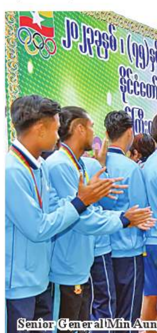
Senior General Min Aung Hlaing presents cash award to the winning team.