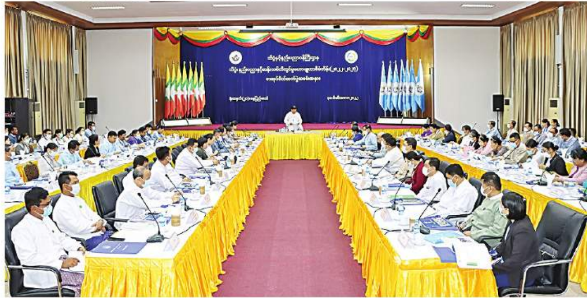
သိပ္ပံ၊ နည်းပညာနှင့် ဆန်းသစ်တီထွင်မှုမဟာဗျူဟာစီမံကိန်း(၂၀၂၂-၂၀၂၇) စာအုပ်မိတ်ဆက်ပွဲအခမ်းအနားကျင်းပစဉ်။