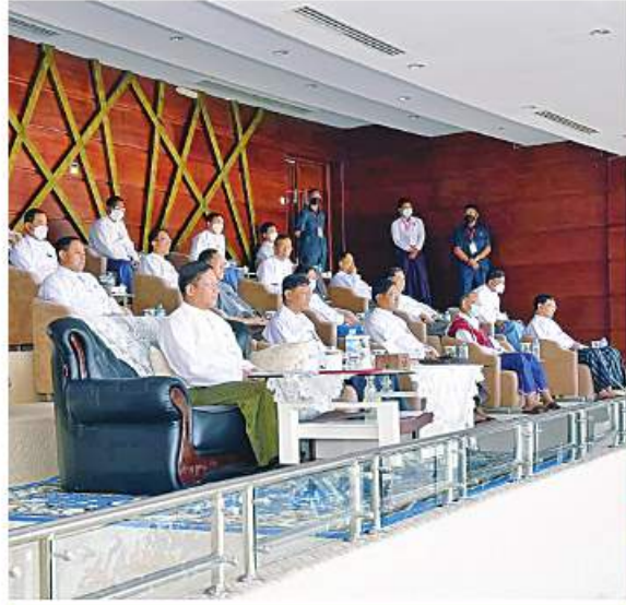
Senior General Min Aung Hlaing watches the final match