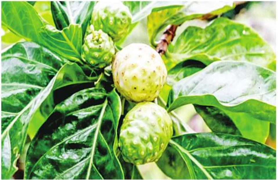
ဆေးဖက်ဝင် ရဲယိုသီးကို တွေ့ရစဉ်။

မေး ။ ။ ဆရာဝန်များ ကျွန်တော့်မှာ သွေးဖုံးရေစီး ကမ်းပြိုဖြစ်ပြီး အသွေးတွေ နဲ့လာပါ တယ်။ တစ်ခါတစ်ရံ သွေးဖုံးကသွေးယို ပါတယ်။ အချို့နဲ့ ရေခဲရေ အအေးတွေ လဲ သောက်လိုမှရပါ။ ရေနွေးပူလဲ သောက်လိုမှရပါ။ ဘယ်လိုလုပ်ရမယ် ဆိုတာ ညွှန်ကြားပေးပါစေရအောင်။ ဖြေ ။ ။ ပျားရည်ပေးပါ။ ကွမ်းသီးခြောက်ကို ပြာချပြီး သွားအခြေမှာသိပ်ပေးပါ။ တမာရွက်ပြုတ်ရည်လဲ ပေးပါ။ ဝမ်း တွင်းသားတွေ စားတာရှောင်ပါ။ အချဉ် တည်ထားတဲ့အသားတွေ စားတာရှောင် ပါ။ အစာစားပြီးတိုင်း ဆားရည်နဲ့ပလုတ် ကျင်းပေးပါ။ အပူအပုပ်တွေအထက်ကို မတက်စေဖို့ ညအိပ်ရာဝင်ခါနီး ခြေဖဝါး ဆားပွတ်၊ ဂူးအထက်ကနေအောက် ရေအေးလောင်း ခြေဆေးပြီးမှအိပ်ပါ။