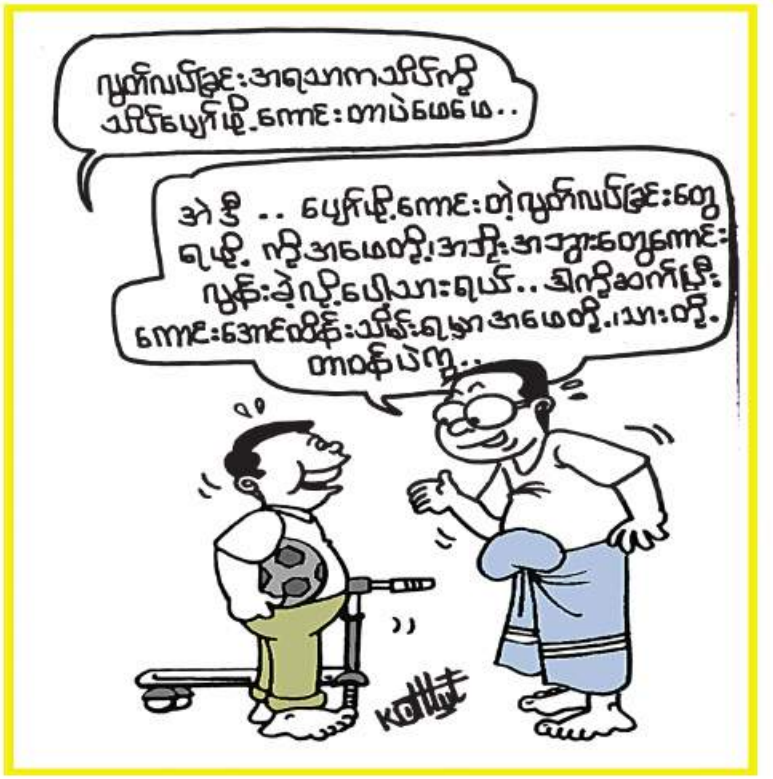
ပျက်ပျက်ခြင်းအရသာကသာပီကို သာပီပျက်ပျက်ခြင်းကောင်းတာပဲမေမေ.. ဒါ ဒီ .. ပျက်ပျက်ခြင်းတွေ ရှေးရှေးက အမေတို့အား အဘွားတွေကောင်းပျက်ပျက်ပျက်ပျက်.. ဒါကွဲအဝက်ပျက် ကောင်းအောင်ထိန်းသိမ်းရမှာ အမေတို့.. သားတို့.. တာဝန်ပဲကွဲ..

ဘာညီကျေးရွာ၌ အလျား ပေ ၁၀၀၊ အနံ ပေ ၁၀၀၊ အနက်ခြောက်ပေရှိ မြေသားရေကန်တူးဖော်ခြင်းနှင့် အရှည် ပေ ၆၀၀ ခြံစည်းရိုးကာရံခြင်းလုပ်ငန်းများကို တာရာလင်းလက်ထွန်းကုမ္ပဏီက တာဝန်ယူ၍ မေ ၂၅ ရက်က စတင်ဆောင်ရွက်ခဲ့ရာ ယခုအခါ လုပ်ငန်းများရာနှုန်းပြည့် ဆောင်ရွက်ပြီးစီးပြီဖြစ်၍ ကျေးရွာရှိ အိမ်ခြေ ၂၈၆ အိမ်၊ လူ ၁၃၂၁ ဦးနှင့် ကျွဲ၊ နွားတိရစ္ဆာန်များအတွက် သန့်ရှင်းသော သောက်သုံးရေဖူလုံစွာရရှိတော့မည်ဖြစ်ကြောင်း မြောက်ဦးမြို့နယ် ကျေးလက်ဒေသဖွံ့ဖြိုးတိုးတက်ရေးဦးစီးဌာန မြို့နယ်ဦးစီးမှူး ဦးကျော်ထွန်းလှက ပြောပြ၍ သိရသည်။ ကိုသန်း