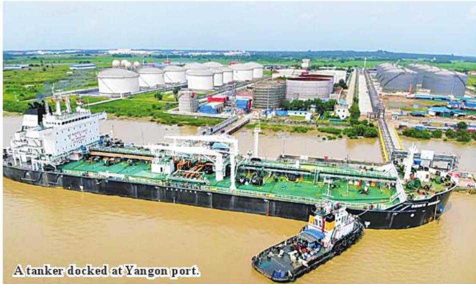
A tanker docked at Yangon port.

Yangon December 30 Port Authority. More than 270 tankers docked at Yangon ports from January to November in this year, according to Myanmar