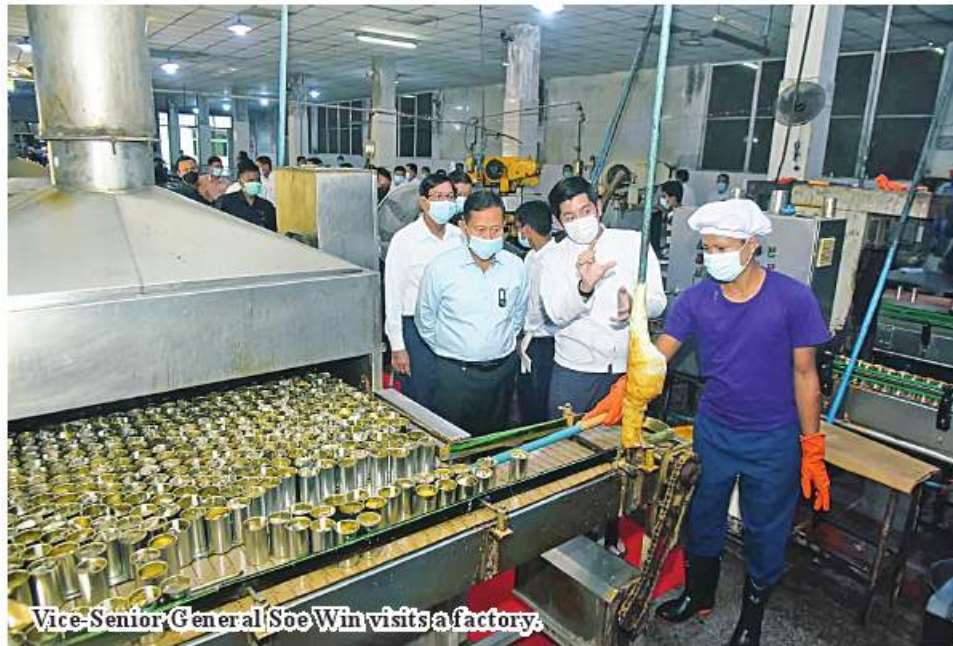
Vice-Senior General Soe Win visits a factory.