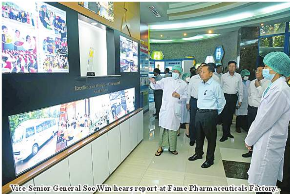
Vice-Senior General Soe Win hears report at Fame Pharmaceuticals Factory.