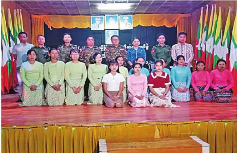
နယ်မြေခံတပ်မတော်သားများနှင့် မိသားစုဝင်များ၊ ပျော်ဖြေရေးအဖွဲ့ သူ၊ အဖွဲ့သားများနှင့် ရပေါင်းခတ်ပုံရိုက်စဉ်။

မိုးမြို့တို့ရှိ ရွှေတန်းစခန်းများနှင့် နယ်မြေခံတပ်ရင်းဌာနချုပ်များသို့ နယ်လှည့်ပြည်သူ့ဆက်ဆံရေးအဖွဲ့များမှ အရာရှိ၊ စစ်သည်၊ စစ်သမီးများ၊ မြန်မာ့အသံနှင့်ရုပ်မြင်သံကြား(MRTV)မှ အဖွဲ့သားများက စစ်ချီတေး၊ စစ်သည်တေးသီချင်းများ၊ ခေတ်ပေါ်နှင့် ခေတ်ဟောင်းတေးသီချင်းများဖြင့် ပျော်ဖြေကြရာ တပ်မတော်သားများနှင့် မိသားစုဝင်များက စိတ်လက်ပျော်ရွှင်ကြည်နူးချမ်းမြေ့စွာဖြင့် ကြည့်ရှုအားပေး၍ အချို့စစ်သည်များနှင့် မိသားစုများက လွတ်လပ်ပေါ့ပစ္စာဖြင့် အတူတကွ ပါဝင်သီဆိုကြပြီး အမှတ်တရပေါင်းစာတ်ပုံများရိုက်ကြသည်။