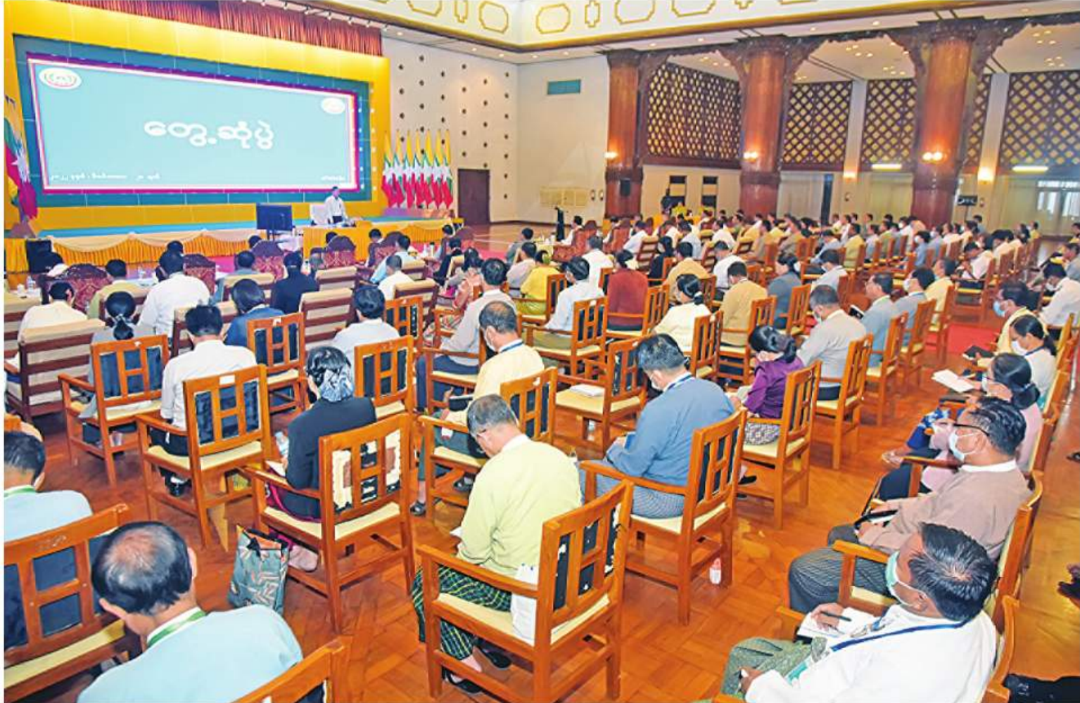
နေပြည်တော် ဒီဇင်ဘာ ၂၀ ရန်ကုန်တိုင်းဒေသကြီး အတွင်းရှိ အသေးစား၊ အငယ်စားနှင့် အလတ်စား စီးပွားရေးလုပ်ငန်းများနှင့်ပတ်သက်၍ တိုင်းဒေသကြီးအစိုးရအဖွဲ့ဝင်များ၊ ခရိုင်၊ မြို့နယ်များမှ တာဝန်ရှိသူများအား တွေ့ဆုံပွဲကို ယနေ့နံနက်ပိုင်းတွင် ရန်ကုန်တိုင်း ဒေသကြီးအစိုးရအဖွဲ့ရုံး အစည်းအဝေးခန်းမ၌ ပြုလုပ်ရာ စာမျက်နှာ ၁၆ ကော်လံ ၁၆

ရန်ကုန်တိုင်းဒေသကြီးအတွင်းရှိ အသေးစား၊ အငယ်စားနှင့် အလတ်စားစီးပွားရေးလုပ်ငန်းများ(MSME)နှင့်ပတ်သက်၍ တိုင်းဒေသကြီးအစိုးရအဖွဲ့ဝင်များ၊ ခရိုင်၊ မြို့နယ်များမှ ဌာနဆိုင်ရာတာဝန်ရှိသူများကို တွေ့ဆုံအမှာစကားပြောကြား လှိုင်းသာယာမြို့နယ်အတွင်းရှိ စက်ရုံအလုပ်ရုံများကို သွားရောက်လေ့လာကြည့်ရှု