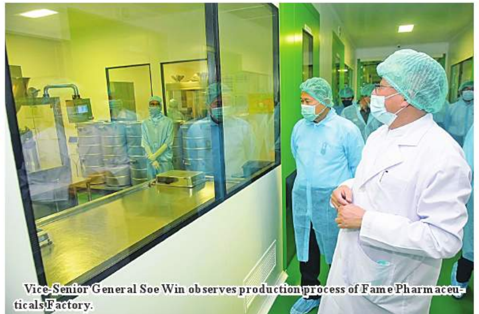
Vice-Senior General Soe Win observes production process of Fame Pharmaceuticals Factory.