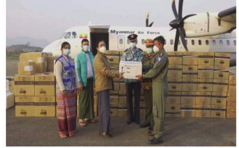
ရှမ်းပြည်နယ်(မြောက်ပိုင်း) လားရှိုးမြို့သို့ ရောက်ရှိလာသော ကိုဗစ်-၁၉ ရောဂါ ကာကွယ်ဆေးနှင့် ဆေးထိုးအပ်များကို တာဝန်ရှိသူများက လက်ခံရယူစဉ်။

နေပြည်တော် ဒီဇင်ဘာ ၂၀ ကိုဗစ်-၁၉ ရောဂါ ကာကွယ်၊ ထိန်းချုပ်၊ ကုသရေးလုပ်ငန်းများတွင် အဓိက ကျသည့် ကိုဗစ်-၁၉ ရောဂါကာကွယ်ဆေး ထိုးခြင်းလုပ်ငန်းများကို တပ်မတော်သား ဆရာဝန်များ၊ ကျန်းမာရေးဝန်ထမ်းများ၊ လူမှုရေးအသင်းအဖွဲ့များ ပူးပေါင်း၍ နိုင်ငံတစ်ဝန်းတွင် အင်တိုက်အားတိုက် ဆောင်ရွက်ပေးလျက်ရှိရာ ၎င်းလုပ်ငန်းများ တွင် အထောက်အကူဖြစ်စေရန်အတွက် ကိုဗစ်-၁၉ ရောဂါ ကာကွယ်ဆေးများကို သတ်မှတ်အအေးလမ်းကြောင်း စံချိန် စံညွှန်းများအတိုင်း တိုင်းဒေသကြီးနှင့် ပြည်နယ်အသီးသီးသို့ တပ်မတော်လေယာဉ် များ၊ ရဟတ်ယာဉ်များ၊ Cold Chain Delivery Logistics မော်တော်ယာဉ်ကြီး များဖြင့် ပို့ဆောင်ဖြန့်ဖြူးပေးလျက်ရှိသည်။