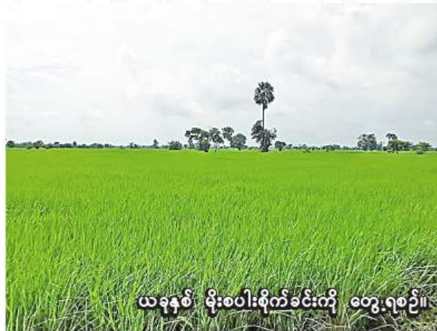
ယခုနှစ် မိုးစပါးစိုက်ခင်းကို တွေ့ရစဉ်။

ပိုးမွှားကျရောက်မှု မရှိစေရေးနှင့် ဓာတ်မြေဩဇာ ဈေးကြီးနေ၍ သဘာဝမြေဩဇာများ သုံးစွဲတတ်လာရေးသက်ဆိုင်ရာ စိုက်ပျိုးရေးဦးစီးဌာနက ဆောင်ရွက်ပေးလျက် ရှိကြောင်း သိရသည်။ (၂၀၆)