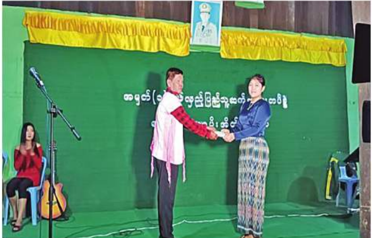
လာရောက်သီဆိုပျော်ဖြေပေးကြသည့် အဖွဲ့ သူ၊ အဖွဲ့သားများကို တာဝန်ရှိသူ တစ်ဦးက ဂုဏ်ပြုဆုပေးပေးပေးအပ်ချီးမြှင့်စဉ်။

ထိုကဲ့သို့ လာရောက်သီဆိုပျော်ဖြေပေးကြသည့် အဖွဲ့ သူ၊ အဖွဲ့သားများကို တောင်ပိုင်းတိုင်းစစ်ဌာနချုပ်ရှိ နယ်မြေခံတပ်များမှ တာဝန်ရှိသူများက ဂုဏ်ပြုဆုပေးပေးခြင်းနှင့် မိသားစုဝင်များက လက်ဆောင်ပစ္စည်းများ ပေးအပ်ကြပြီး ဒေသထွက်အစားအစာများဖြင့် ဧည့်ခံကျွေးမွေးခဲ့ကြကြောင်း သတင်းရရှိသည်။