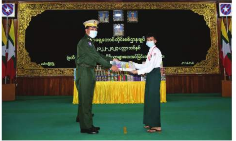
အရှေ့တောင်တိုင်းစစ်ဌာနချုပ် တိုင်းမှူး၊ ဗိုလ်ချုပ်မြတ်သက်ဦး ကျောင်းသား တစ်ဦးကို စာရေးကိရိယာများ ထောက်ပံ့ပေးအပ်စဉ်။

နေပြည်တော် ဒီဇင်ဘာ ၂၀ ၂၀၂၂-၂၀၂၃ ပညာသင်နှစ်တွင် တက်ရောက် ပညာသင်ကြားလျက်ရှိ သည့် အရှေ့တောင်တိုင်းစစ်ဌာနချုပ်ရှိ တပ်မတော်သားမိသားစုဝင် ကျောင်းသား၊ ကျောင်းသူများအတွက် ဒုတိယအကြိမ် စာရေးကိရိယာများ ထောက်ပံ့ပေးအပ်ခြင်း ကို ယနေ့ညနေပိုင်းတွင် တိုင်းစစ်ဌာနချုပ် အောင်ဆန်းခန်းမ၌ပြုလုပ်ရာ တိုင်းမှူး ဗိုလ်ချုပ်မြတ်သက်ဦးနှင့် အရာရှိ၊ စစ်သည်၊ မိသားစုဝင်များ၊ ကျောင်းသား၊ ကျောင်းသူ များ တက်ရောက်ကြသည်။ ဦးစွာ တိုင်းမှူးက အမှာစကားပြောကြား