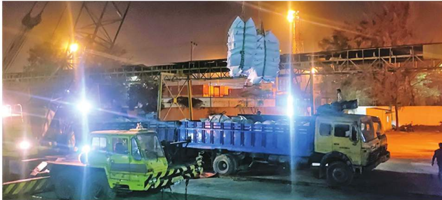
ဘင်္ဂလားဒေ့ရှ်နိုင်ငံ CHATTOGRAM ဆိပ်ကမ်းတွင် ညပိုင်း၌ မြန်မာ့ဆန်များ ချနေမှုကို တွေ့ရစဉ်။

ရန်ကုန် ဒီဇင်ဘာ ၂၀ ပြည်တွင်းစိုက်ပျိုးထုတ်လုပ်မှုမှ ပိုလျှံသော မြန်မာ့ဆန်များကို ပြည်ပဝယ်လိုအားအရ ဘင်္ဂလားဒေ့ရှ်နိုင်ငံသို့ တင်ပို့လျက်ရှိရာ G to Gစာချုပ်အရ တင်ပို့ရမည့်ဆန်တန်ချိန်နှင့်သိန်းတွင် တင်ပို့ရန် ကျန်ရှိသောဆန်များကို ရန်ကုန်ဆိပ်ကမ်းနှင့် ပုသိမ်စက်မှုမြို့တော်ဆိပ်ကမ်းတို့မှ တင်ပို့သွားမည်ဖြစ်ကြောင်း သိရသည်။ ၂၀၂၃ ခုနှစ် ဇန်နဝါရီ ၁၅ ရက်အတွင်း အပြီးသတ် တင်ပို့သွားမည်ဖြစ်ကြောင်း သိရသည်။ ဘင်္ဂလားဒေ့ရှ်နိုင်ငံသို့ ဆန်တင်ပို့ရာတွင် ပုသိမ်စက်မှုမြို့တော်ဆိပ်ကမ်းမှ နိုဝင်ဘာ ၂ ရက်တွင် ပထမဆုံးသင်္ဘော MCL-7 ဖြင့် ဆန်တန်ချိန် ၂၆၅၀ တင်ပို့ခဲ့ပြီး နောက်ပိုင်းတွင် နေ့စဉ်တင်ပို့ရောင်းချပေးနေ