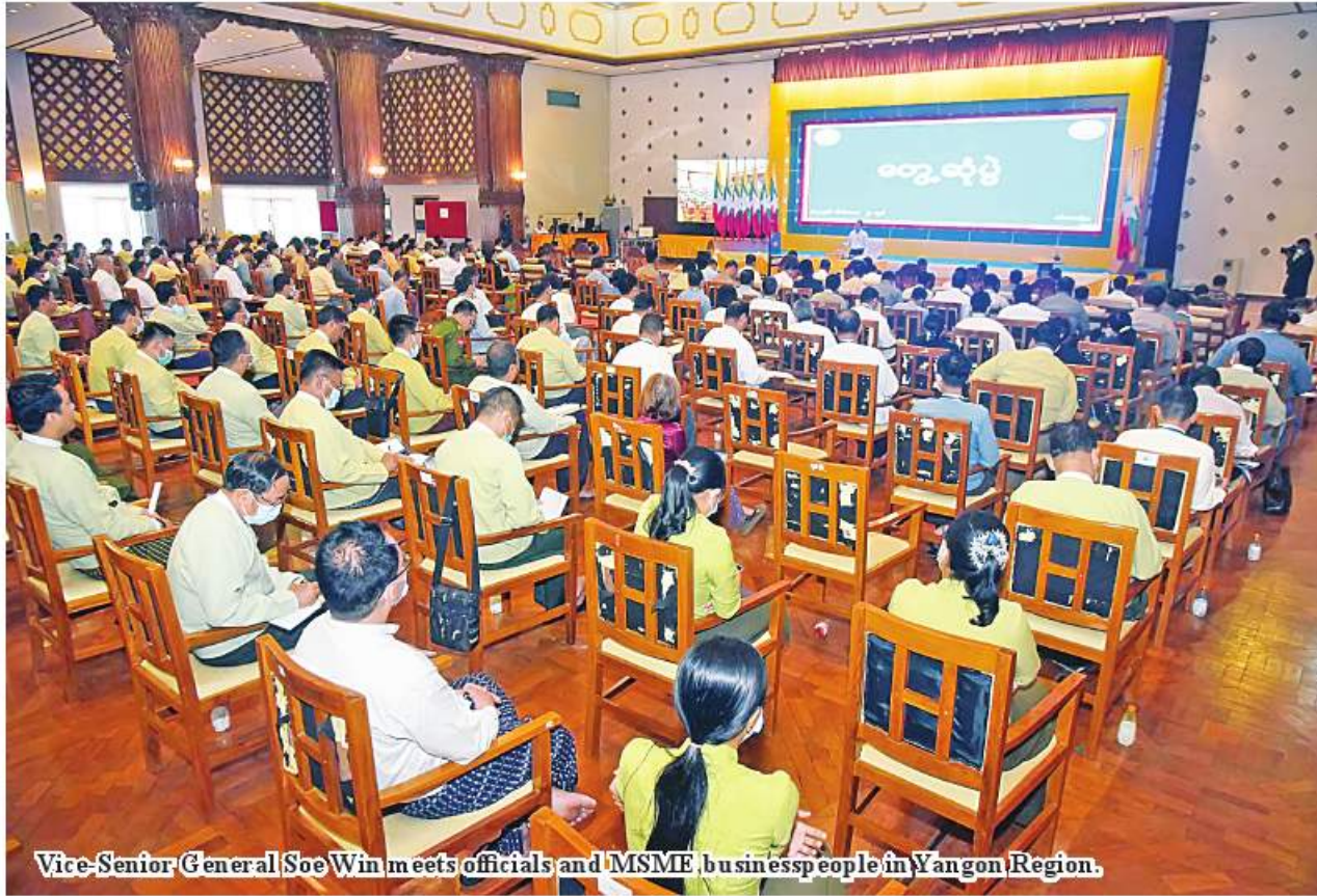
Vice-Senior General Soe Win meets officials and MSME business people in Yangon Region.

Nay Pyi Taw December 28 A meeting of Yangon Region cabinet members and district/township officials was held in connection with MSMEs of the region at Yangon Region Government Office this morning with an address by Vice Chairman of State Administration Council Deputy Commander-in-Chief of Defence Services Commander-in-Chief (Army) Vice-Senior General