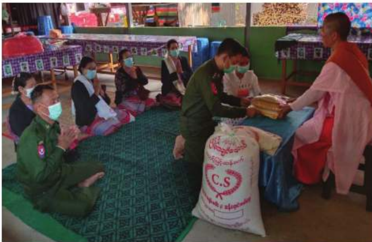
ပုသိမ်ကြီးမြို့နယ် ကြို့ဝန်းကျေးရွာ ဥတ္တရရံသီ သီလရှင်စာသင်တိုက်ရှိ သာသနာ့နယ်ဝင်သီလရှင်များကို အလယ်ပိုင်းတိုင်းစစ်ဌာနချုပ်မှ တာဝန်ရှိသူများက ဆွမ်းဆန်တော်၊ ဆီ၊ ဆား၊ ပဲ အမည် လေးမျိုး ဆက်ကပ်လှူဒါန်းစဉ်။

နေပြည်တော် ဒီဇင်ဘာ ၂၀ ကိုဗစ်-၁၉ ရောဂါ ကြိုတင်ကာကွယ်ရေး လုပ်ငန်းများ ဆောင်ရွက်နေသည့်ကာလ အတွင်း ဆွမ်းကိစ္စရပ်များအဆင်ပြေ စေရန်ရည်ရွယ်၍ တပ်မတော်(ကြည်း၊ ရေ၊ လေ) အရာရှိ၊ စစ်သည်၊ အရာထမ်း၊ အမှုထမ်းများနှင့် စေတနာ့ရှင်အလှူရှင် များက မြို့နယ်အသီးသီးရှိ ဘုန်းတော်ကြီး ကျောင်းများ၊ သာသနာ့နယ်ဝင်သီလရှင် ကျောင်းများ၊ ဘာသာရေးကျောင်းများနှင့် ဘိုးဘွားရိပ်သာများသို့ ဆွမ်းဆန်တော်၊ ဆီ၊ ဆား၊ ပဲ အမည် လေးမျိုးနှင့် လှူဖွယ် ပစ္စည်းများလှူဒါန်းခြင်း၊ နေ့ဆွမ်းများ ဆက်ကပ်လှူဒါန်းခြင်းနှင့် လိုအပ်သည့် ကျန်းမာရေးစစ်ဆေးကုသပေးခြင်းများကို ဆောင်ရွက်လျက်ရှိသည်။