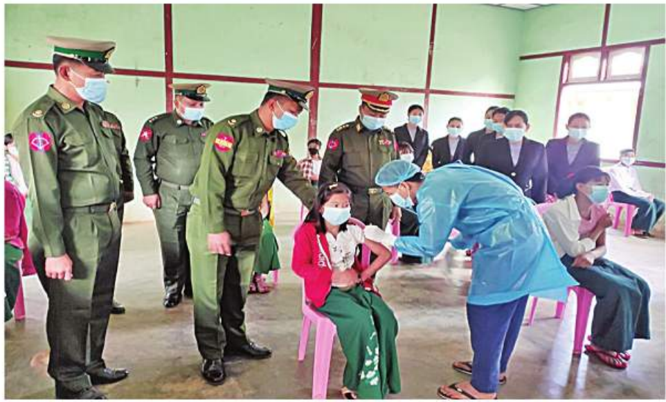
စစ်ကိုင်းတိုင်းဒေသကြီး ခန္တီးမြို့၌ ကျောင်းသား၊ ကျောင်းသူများကို ကိုဗစ်-၁၉ ရောဂါ ကာကွယ်ဆေး ထိုးနှံပေးစဉ်။

ဆရာဝန်များ၊ သက်ဆိုင်ရာ ကျန်းမာရေးဝန်ထမ်းများ၊ စေတနာ့ဝန်ထမ်းများနှင့် ပူးပေါင်း၍ ကိုဗစ်-၁၉ ရောဂါကာကွယ်ဆေးထိုးနှံပေးခြင်းများ ဆောင်ရွက်ပေးသည်။ ထို့အတူ ကျောင်းသား၊ ကျောင်းသူများကိုလည်း ကိုဗစ်-၁၉ ရောဂါကာကွယ်ဆေးထိုးနှံပေးလျက်ရှိရာ ယနေ့တွင် စစ်ကိုင်းတိုင်းဒေသကြီး ခန္တီးမြို့၌ ကျောင်းသား၊ ကျောင်းသူ ၄၄ ဦးကို တပ်မတော်မှ ဆေးအဖွဲ့များက ပြည်သူ့ဆေးရုံများမှ ဆရာဝန်များ၊ သက်ဆိုင်ရာ ကျန်းမာရေးဝန်ထမ်းများ၊ စေတနာ့ဝန်ထမ်းများနှင့် ပူးပေါင်း၍ ကိုဗစ်-၁၉ ရောဂါကာကွယ်ဆေးထိုးနှံပေးခြင်းများ ဆောင်ရွက်ပေးခဲ့ကြောင်း သတင်းရရှိသည်။