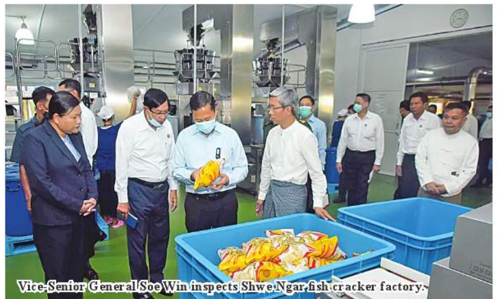
Vice-Senior General Soe Win inspects Shwe Ngar fish cracker factory.

The Vice-Senior General and party also inspected the production processes of the foodstuffs and packaging tasks of the factories and coordinated the needs of the factories. 100