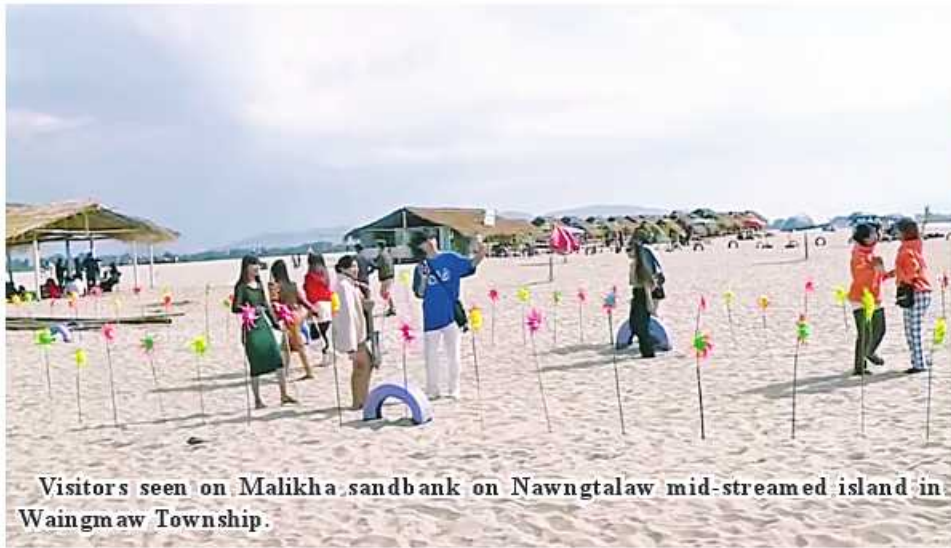
Visitors seen on Malikha sandbank on Nawngtalaw mid-streamed island in Waingmaw Township.

Waingmaw December 25 The small beach of Malikha sandbank on Nawngtalaw mid-streamed island is crowded with travellers who take relaxation, in Waingmaw Township of Kachin State, said central executive