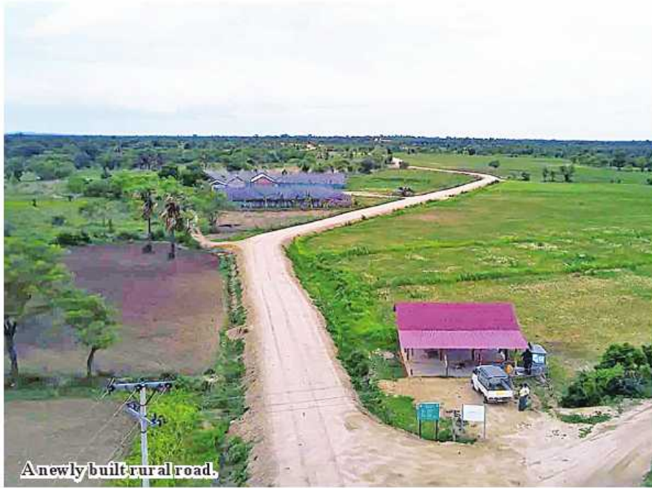
A newly built rural road.

Nay Pyi Taw December 25 More than 87 miles of rural production roads and over 200 rural production