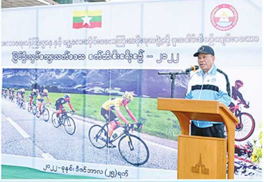
မန္တလေးတိုင်းဒေသကြီးဝန်ကြီးချုပ် ဦးမောင်ကို ပြင်ဦးလွင်ကျေးလက်ဒေသ စက်ဘီးစီးခရီးစဉ်- ၂၀၂၂ ဖွင့်ပွဲအခမ်းအနားတွင် အမှာစကားပြောကြားစဉ်။

မန္တလေး၊ ဒီဇင်ဘာ ၂၅ - မန္တလေးတိုင်းဒေသကြီးဝန်ကြီးချုပ် ဦးမောင်ကို၊ တိုင်းဒေသကြီးဝန်ကြီးများ၊ ပြင်ဦးလွင်တပ်နယ်မှူး၊ ဟိုတယ်နှင့် ခရီးသွားလာရေးဝန်ကြီးဌာန ညွှန်ကြားရေးမှူးချုပ်၊ မြန်မာနိုင်ငံခရီးသွားလုပ်ငန်းအဖွဲ့ချုပ်နှင့် ညီနောင်အသင်းများမှ တာဝန်ရှိသူများ၊ ကျောင်းသား၊ ကျောင်းသူများ၊ စက်ဘီးစီးသမားများနှင့် ဝါသနာရှင်များ၊ ဒေသခံပြည်သူများ စုစုပေါင်းအင်အား ၅၀၀ ကျော် တက်ရောက်ဆင်နွှဲကြသည်။ အခမ်းအနား၌ တိုင်းဒေသကြီးဝန်ကြီးချုပ်က အဖွင့်အမှာစကားပြောကြားရာတွင် ကိုဗစ်-၁၉ ရောဂါကြောင့် ရပ်တန့်နေသည့် ခရီးသွားလုပ်ငန်းများ ပြန်လည်သက်ဝင်ဖွံ့ဖြိုးတိုးတက်လာရန်အတွက် ဒီဇင်ဘာလအားကစားပုံရိပ်ဖြင့် ခရီးသွားမြှင့်တင်ရေးလှုပ်ရှားမှုတစ်ရပ်အဖြစ် စက်ဘီးစီးပွဲတော်ကို ကျင်းပခြင်းဖြစ်ကြောင်း၊ ပြင်ဦးလွင်ဒေသ၏ ခရီးသွားလုပ်ငန်းဖွံ့ဖြိုးတိုးတက်ရေးတွင်