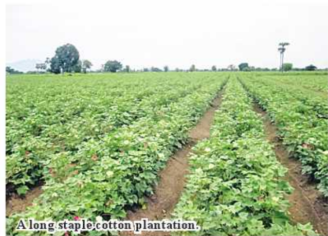
A long staple cotton plantation.

Cultivation of cotton strains is sure to meet the demand of cotton ginning factories. 185