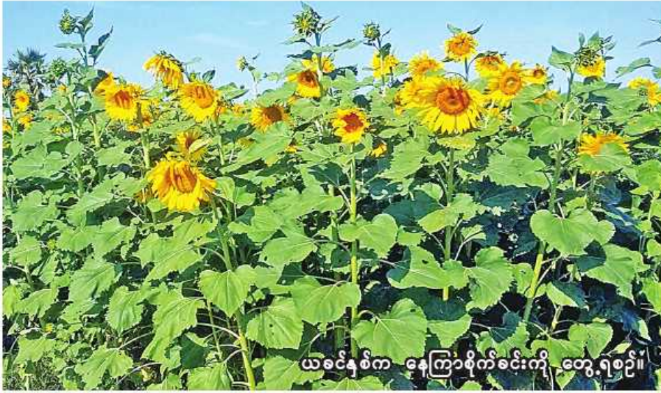
ယခင်နှစ်က နေကြာစိုက်ခင်းကို တွေ့ရစဉ်။