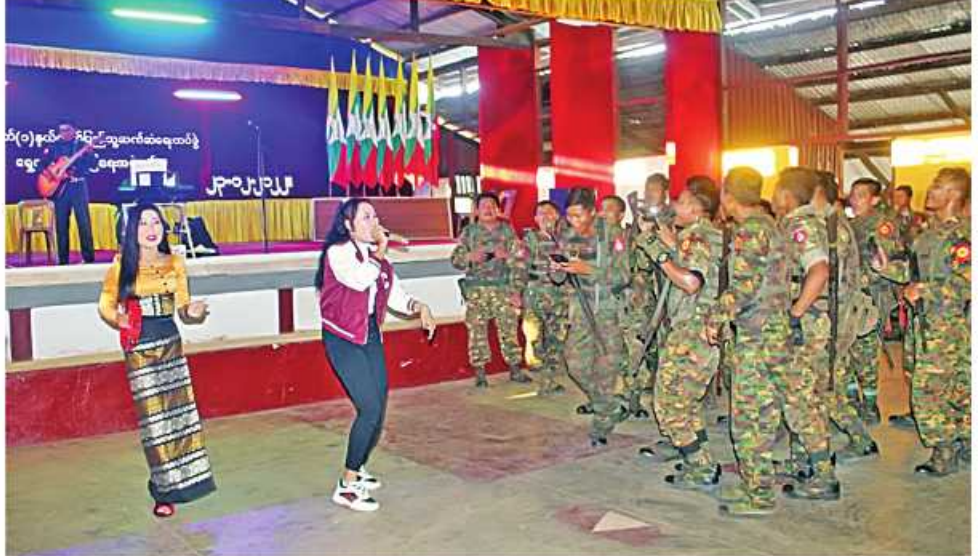
အရှေ့ပိုင်းတိုင်းစစ်ဌာနချုပ် တိုင်းမှူး ဝိသုဒ္ဓိလှဝင်း၊ မြန်မာ့အသံနှင့် ရုပ်မြင်သံကြား(MRTV) ဖျော်ဖြေရေးအဖွဲ့ကို ဂုဏ်ပြုဆုတောင်းပေး အပ်ချီးမြှင့်စဉ်။