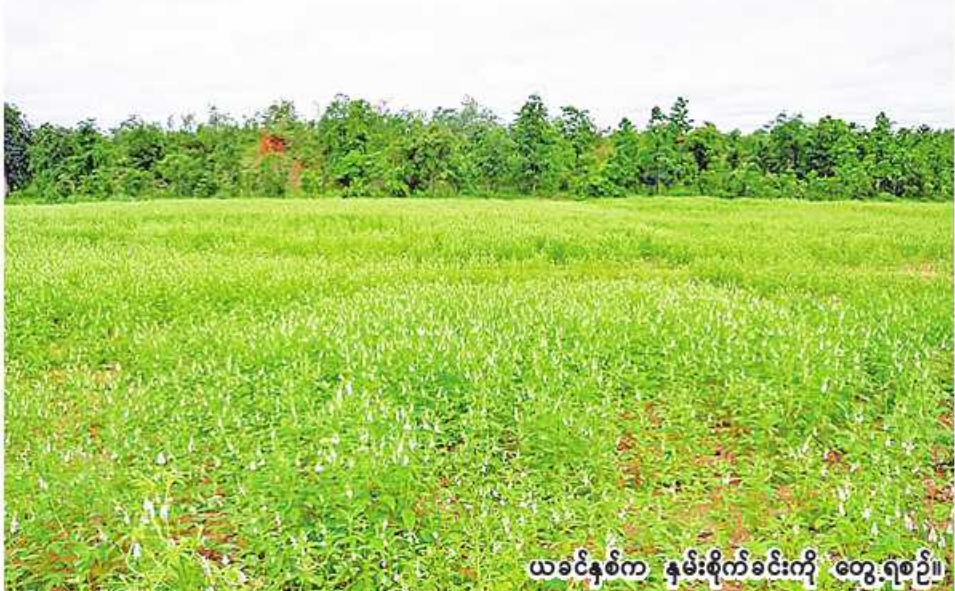
ယခင်နှစ်က နှမ်းစိုက်ခင်းကို တွေ့ရစဉ်။

လပွတ္တာ ဒီဇင်ဘာ ၂၅ ရောဝတီတိုင်းဒေသကြီး လပွတ္တာခရိုင် လပွတ္တာမြို့နယ်တွင် ယခုနှစ် ဆောင်းသီးနှံစိုက်ပျိုးရာသီ ၌ ဆီထွက်သီးနှံ နှမ်း ၁၄၉ ဧက စိုက်ပျိုးပြီးစီးပြီဖြစ်ကြောင်း လပွတ္တာ မြို့နယ် စိုက်ပျိုးရေးဦးစီးဌာနမှ သိရသည်။