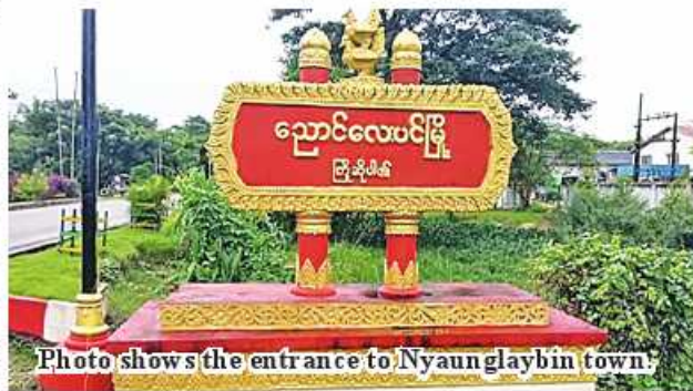
Photo shows the entrance to Nyaunglaybin town.

traffic congestion. CCTVs have been installed in many parts of Bago including the entrance to Yangon. Those CCTVs will be controlled by the control centre. 336