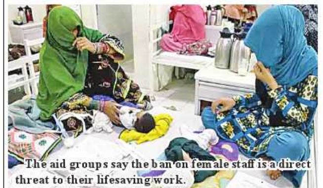
The aid groups say the ban on female staff is a direct threat to their lifesaving work.