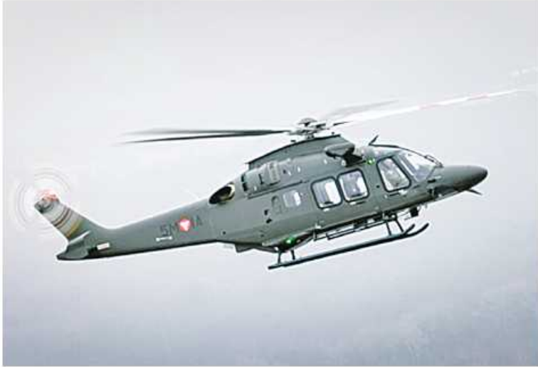
ဩစတြီးယားကာကွယ်ရေးဝန်ကြီးဌာနက ပထမဆုံး AW169M အပေါ့စား အီတလီနိုင်ငံကာကွယ်ရေးကုမ္ပဏီ လီယိုနာ

ဒီထံမှ လွှဲပြောင်းလက်ခံရရှိခဲ့သည်။ အဆိုပါရဟတ်ယာဉ်သည် ၂၀၂၁ ခုနှစ်အတွင်းက အီတလီ-ဩစတြီးယားနိုင်ငံ တို့ အစိုးရနှစ်ရပ်ကြား သဘောတူညီချက် ၏ တစ်စိတ်တစ်ပိုင်းအဖြစ် ဝယ်ယူခဲ့ကြ သည့်ရဟတ်ယာဉ် ၁၈ စီးထဲမှ ပထမဆုံး လေယာဉ်ဖြစ်သည်။ ဩစတြီးယားနိုင်ငံက ပံ့ပိုးပို့ဆောင်ရေး ဆိုင်ရာပြဿနာများကြောင့် 429 Global Ranger နှင့် H145M အင်ဂျင်နစ်လုံး တပ်ရဟတ်ယာဉ်များထဲမှ AW169M ကို ရွေးချယ်ခဲ့ခြင်းလည်းဖြစ်သည်။ ရဟတ်ယာဉ်အသစ်များ ဝယ်ယူဖြည့် တင်းနိုင်ခဲ့ခြင်းကြောင့် သက်တမ်းရင့် Alouette III အပေါ့စားသယ်ယူပို့ဆောင်