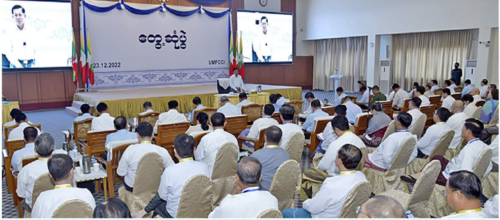
နိုင်ငံတော်စီမံအုပ်ချုပ်ရေးကောင်စီဥက္ကဋ္ဌ နိုင်ငံတော်ဝန်ကြီးချုပ် ဗိုလ်ချုပ်မှူးကြီးမင်းအောင်လှိုင် ပြည်ထောင်စုသမ္မတမြန်မာနိုင်ငံ ကုန်သည်များနှင့်စက်မှုလက်မှုလုပ်ငန်းရှင်များအသင်းချုပ်(UMFCCI) ညီနောင်အသင်းအဖွဲ့များမှ တာဝန်ရှိသူများကို တွေ့ဆုံစဉ်။

နေပြည်တော် ဒီဇင်ဘာ ၂၃ - အဖွဲ့များမှ တာဝန်ရှိသူများကို ရန်ကုန်မြို့ နိုင်ငံတော်စီမံအုပ်ချုပ်ရေးကောင်စီ ဥက္ကဋ္ဌ ကုန်သည်များနှင့် စက်မှုလက်မှုလုပ်ငန်းရှင်များအသင်းချုပ် (UMFCCI) မင်္ဂလာခန်းမ၌ တွေ့ဆုံသည်။ အဆိုပါတွေ့ဆုံပွဲသို့ နိုင်ငံတော်စီမံအုပ်ချုပ်ရေးကောင်စီဥက္ကဋ္ဌ နိုင်ငံတော်ဝန်ကြီးချုပ်နှင့်အတူ ကောင်စီတွဲဖက်အတွင်းရေးမှူး ဒုတိယဗိုလ်ချုပ်ကြီး ရဲဝင်းဦး၊ ကောင်စီဝင်များဖြစ်ကြသည့် ဗိုလ်ချုပ်ကြီး မြထွန်းဦး၊ ဗိုလ်ချုပ်ကြီးတင်အောင်စန်း၊ ပြည်ထောင်စုဝန်ကြီးများ၊ ရန်ကုန်တိုင်းဒေသကြီးဝန်ကြီးချုပ်၊ ကာကွယ်ရေးဦးစီးချုပ်ရုံးမှ တပ်မတော်အရာရှိကြီးများ၊ ရန်ကုန်တိုင်းစစ်ဌာနချုပ်တိုင်းမှူးနှင့် တာဝန်ရှိသူများ၊ ရန်ကုန်မြို့တော်ဝန်၊ ပြည်ထောင်စုသမ္မတမြန်မာနိုင်ငံကုန်သည်များနှင့် စက်မှုလက်မှုလုပ်ငန်းရှင်များအသင်းချုပ်(UMFCCI)မှ ဗဟိုအလုပ်အမှုဆောင်များ၊ ညီနောင်အသင်းအဖွဲ့များမှ တာဝန်ရှိသူများ တက်ရောက်ကြသည်။