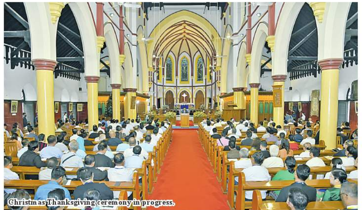
Christmas Thanksgiving ceremony in progress.

People of Buddhism, professed by the largest number of