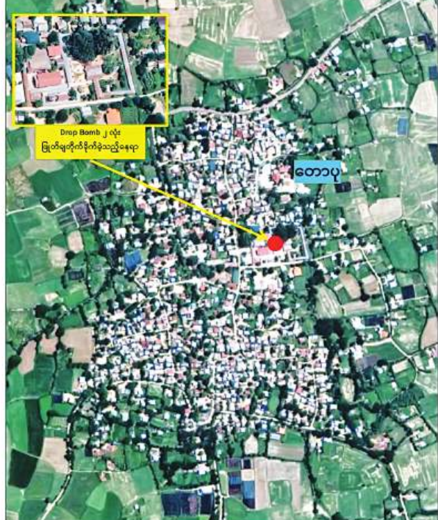
တောပုကျေးရွာရှိ ဘုရားကြီးဘုန်းတော်ကြီးကျောင်းဝင်းအတွင်းသို့ Drop Bomb နှစ်လုံး ပြုတ်ကျတိုက်ခတ်ခဲ့သည့် နေရာပြပုံ။