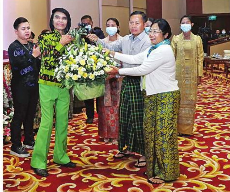
နိုင်ငံတော်စီမံအုပ်ချုပ်ရေးကောင်စီဒုတိယဥက္ကဋ္ဌ ဒုတိယတပ်မတော်ကာကွယ်ရေး ဦးစီးချုပ် ကာကွယ်ရေးဦးစီးချုပ်(ကြည်း) ဒုတိယဗိုလ်ချုပ်မှူးကြီးစိုးဝင်းနှင့် စခန်း ဒေါ်သန်းသန်းနွယ်တို့က မြန်မာပြည်သိန်းတန်နှင့်အဖွဲ့အား ဂုဏ်ပြုပန်းခြံပေးအပ်စဉ်။

နှင့် မိသားစုဝင်များ တက်ရောက်ကြည့်ရှု အားပေးကြသည်။ ဦးစွာ မြန်မာပြည်သိန်းတန်နှင့် အဖွဲ့ က ရတနာပုံ၊ အောင်စေ-တည်စေ-ညီစေ၊ ယောသူတို့ရွာ၊ မပေဒါ၊ စနေထောင့်မှာ ပန်းလျှံမယ်၊ မြစ်ဆုံသို့လွမ်းစိတ်မပြေ၊ ရွှေသူနှစ်ရီ၊ သောကတောင်တန်း၊ ချစ်သူချင်း မို့ သိန်းလည်၊ ကောင်းသောည စသည် တေးသီချင်းများဖြင့်သီဆို၍ တေးသရုပ်ဖော် များဖြင့် ဖျော်ဖြေတင်ဆက်ကြရာ တက်ရောက်လာကြသူများက ပျော်ရွှင် ကြည်နူးစွာကြည့်ရှုအားပေးကြသည်။