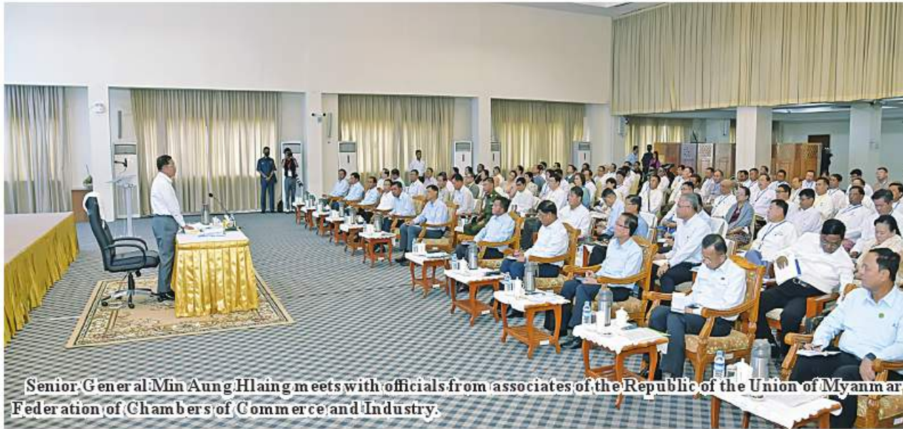
Senior General Min Aung Hlaing meets with officials from associates of the Republic of the Union of Myanmar Federation of Chambers of Commerce and Industry.