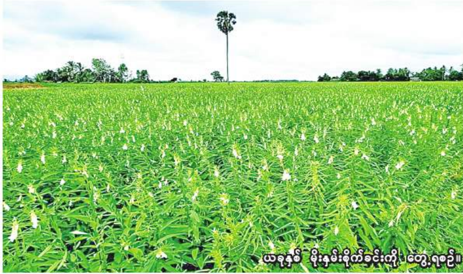
ယခုနှစ် မိုးနှမ်းစိုက်ခင်းကို တွေ့ရစဉ်။