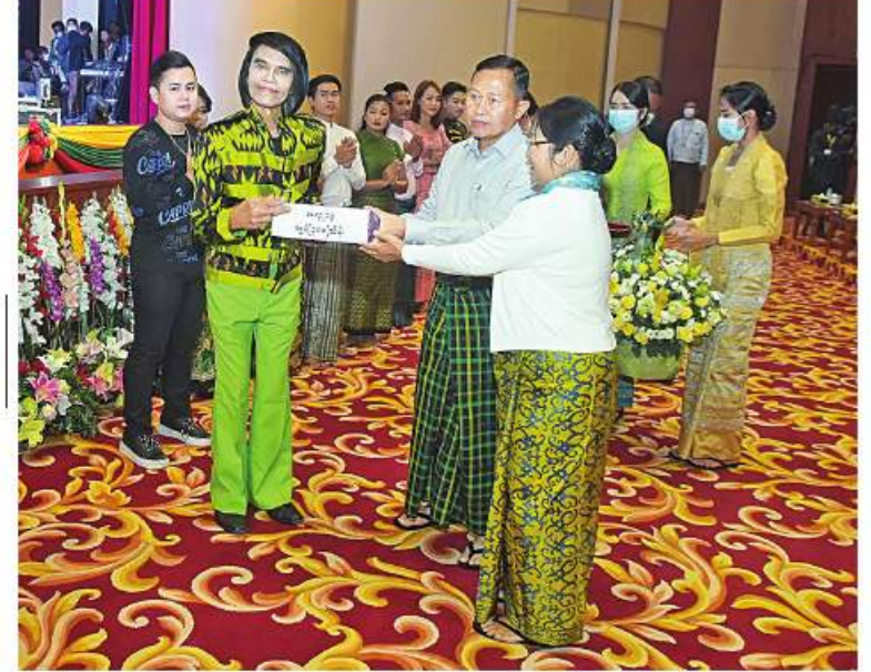
နိုင်ငံတော်စီမံအုပ်ချုပ်ရေးကောင်စီဒုတိယဥက္ကဋ္ဌ ဒုတိယတပ်မတော်ကာကွယ်ရေး ဦးစီးချုပ် ကာကွယ်ရေးဦးစီးချုပ်(ကြည်း) ဒုတိယဗိုလ်ချုပ်မှူးကြီးစိုးဝင်းနှင့် စခန်း ဒေါ်သန်းသန်းနွယ်တို့က တပ်မတော်(ကြည်း၊ ရေ၊ လေ) မိသားစုများက လှူဒါန်း သည့် အလှူငွေကျပ်သိန်း ၃၀၀ ကို မြန်မာပြည်သိန်းတန်နှင့်အဖွဲ့အား ပေးအပ်စဉ်။

သီဆိုဖျော်ဖြေပွဲအပြီးတွင် နိုင်ငံတော် စီမံအုပ်ချုပ်ရေးကောင်စီ ဒုတိယဥက္ကဋ္ဌ ဒုတိယတပ်မတော်ကာကွယ်ရေးဦးစီးချုပ် ကာကွယ်ရေးဦးစီးချုပ်(ကြည်း)နှင့် ဇနီးတို့ က မြန်မာပြည်သိန်းတန်နှင့်အဖွဲ့ကို ဂုဏ်ပြု ပန်းခြံနှင့် တပ်မတော်(ကြည်း၊ ရေ၊ လေ) မြန်မာနိုင်ငံအနှံ့အပြားရှိ မိဘမဲ့ကလေးများ (ရင်ခွင်မဲ့ကလေးများ)ကို ထောက်ပံ့ကူညီ ဆောင်ရွက်နိုင်ရေးအတွက် တေးသံရှင် မြန်မာပြည်သိန်းတန်နှင့် အဖွဲ့က သီဆို ဖျော်ဖြေ တင်ဆက်ခဲ့ခြင်းဖြစ်ကြောင်း သိရသည်။