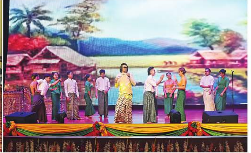
နိုင်ငံတော်စီမံအုပ်ချုပ်ရေးကောင်စီဒုတိယဥက္ကဋ္ဌ ဒုတိယတပ်မတော်ကာကွယ်ရေးဦးစီးချုပ် ကာကွယ်ရေးဦးစီးချုပ်(ကြည်း) ဒုတိယဗိုလ်ချုပ်မှူးကြီးစိုးဝင်းနှင့် စခန်း ဒေါ်သန်းသန်းနွယ်တို့ နိုင်ငံကျော်အဆိုတော် မြန်မာပြည်သိန်းတန်၏ ကြယ်ကလေးများ၏အနာဂတ် တစ်ကိုယ်တော်သီဆိုဖျော်ဖြေပွဲကို ကြည့်ရှုအားပေးစဉ်။

နေပြည်တော် ၁၆ ဇူလိုင် ၂၃ ၂၀၂၃ ခုနှစ် (၇၅)နှစ်မြောက် စိန်ရတု လွတ်လပ်ရေးနေ့ကို ကြိုဆိုရက်ပြုသော အားဖြင့် နိုင်ငံကျော်အဆိုတော် မြန်မာပြည်သိန်းတန်၏ ကြယ်ကလေးများ ၏အနာဂတ် တစ်ကိုယ်တော်သီဆိုဖျော်ဖြေ ပွဲကို ယနေ့ညပိုင်းတွင် နေပြည်တော်ရှိ ဇေယျာသီရိမိမာန် သဘင်ဆောင်အတွင်း ညီကင်းပပြုလုပ်ရာ နိုင်ငံတော်စီမံအုပ်ချုပ်ရေး ကောင်စီဒုတိယဥက္ကဋ္ဌ ဒုတိယတပ်မတော် ကာကွယ်ရေးဦးစီးချုပ် ကာကွယ်ရေး ဦးစီးချုပ်(ကြည်း) ဒုတိယဗိုလ်ချုပ်မှူးကြီး စိုးဝင်း တက်ရောက်ကြည့်ရှု အားပေးသည်။ အဆိုပါသီဆိုဖျော်ဖြေပွဲသို့ နိုင်ငံတော် စီမံအုပ်ချုပ်ရေးကောင်စီ ဒုတိယဥက္ကဋ္ဌ ဒုတိယတပ်မတော်ကာကွယ်ရေးဦးစီးချုပ် ကာကွယ်ရေးဦးစီးချုပ်(ကြည်း)၏ ဇနီး ဒေါ်သန်းသန်းနွယ်၊ နိုင်ငံတော်စီမံ အုပ်ချုပ်ရေးကောင်စီ အတွင်းရေးမှူး ဒုတိယဗိုလ်ချုပ်ကြီးအောင်လင်းဌေး၊ နိုင်ငံ တော်စီမံအုပ်ချုပ်ရေးကောင်စီအဖွဲ့ဝင်များ၊ ကာကွယ်ရေးဦးစီးချုပ်ရုံး(ကြည်း၊ ရေ၊ လေ) မှ တပ်မတော်အရာရှိကြီးများနှင့် ဇနီးများ၊ နေပြည်တော်တိုင်းစစ်ဌာနချုပ် တိုင်းမှူး၊ ရုံး၊ ဌာနအသီးသီးမှ အရာရှိ၊ စစ်သည်များ