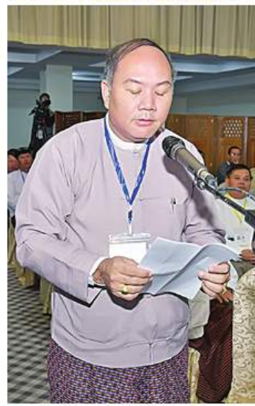
တွေ့ဆုံပွဲသို့တက်ရောက်လာကြသူများက ဆွေးနွေးတင်ပြစဉ်။

များ၏ ရှင်းလင်းတင်ပြမှုများနှင့်ပတ်သက်၍ ပြည်ထောင်စုဝန်ကြီးများဖြစ်ကြသည့် ဦးဝင်းရှိန်၊ ဒေါက်တာကံလော်၊ ဦးလှမိုး၊ ဒေါက်တာချာလီသန်း၊ ဦးအောင်နိုင်ဦးတို့က နိုင်ငံစီးပွားဖွံ့ဖြိုးတိုးတက်ရေးအတွက် ဝိုင်းဝန်းကြိုးပမ်းဆောင်ရွက်လျက်ရှိမှု၊ အသေးစား၊ အငယ်စားနှင့် အလတ်စား စီးပွားရေး (MSME)လုပ်ငန်းများ ဖွံ့ဖြိုးတိုးတက်ရေး ရင်းနှီးမတည်ငွေနှင့် လိုအပ်ချက်များကို တတ်နိုင်သရွေ့ နိုင်ငံတော်က ဖြည့်ဆည်းဆောင်ရွက်ပေးလျက်ရှိမှု၊ လိုင်စင်များနှင့်ပတ်သက်၍ အချိန်နှင့်တစ်ပြေးညီ အမြန်ဆုံးရရှိအောင် ဆောင်ရွက်ပေးလျက်ရှိမှု၊ စိုက်ပျိုးမွေးမြူရေးကိုအခြေခံသည့် ထုတ်ကုန်လုပ်ငန်းများအတွက် လိုအပ်သည့် နည်းပညာနှင့် အရင်းအနှီးများကို သက်ဆိုင်ရာဝန်ကြီးဌာနအလိုက် လိုအပ်သည့်များ ဆောင်ရွက်ပေးလျက်ရှိမှု၊ လျှပ်စစ်စွမ်းအင်သုံး သယ်ယူပို့ဆောင်ရေးယာဉ်များ ဖွံ့ဖြိုးတိုးတက်လာရေးအတွက် ဝန်ကြီးဌာနများမှလည်း ကဏ္ဍအလိုက် ဆောင်ရွက်လျက်ရှိမှုနှင့် စီးပွားရေးကဏ္ဍ ဖွံ့ဖြိုးတိုးတက်ရေးအတွက် ဆောင်ရွက်နေမှု စသည်ဖြင့် သက်ဆိုင်ရာကဏ္ဍများအလိုက် အသီးသီး ပြန်လည်ဆွေးနွေးပြောကြားကြသည်။