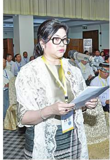
တွေ့ဆုံပွဲသို့တက်ရောက်လာကြသူများက ဆွေးနွေးတင်ပြစဉ်။