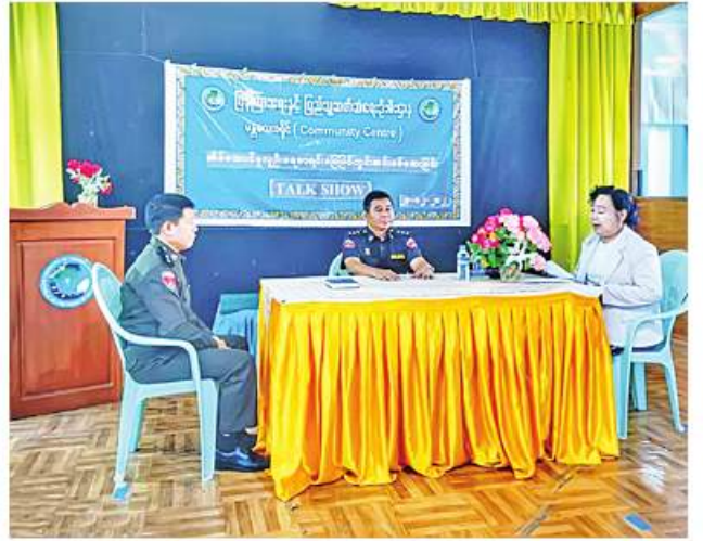
ချမ်းချမ်း