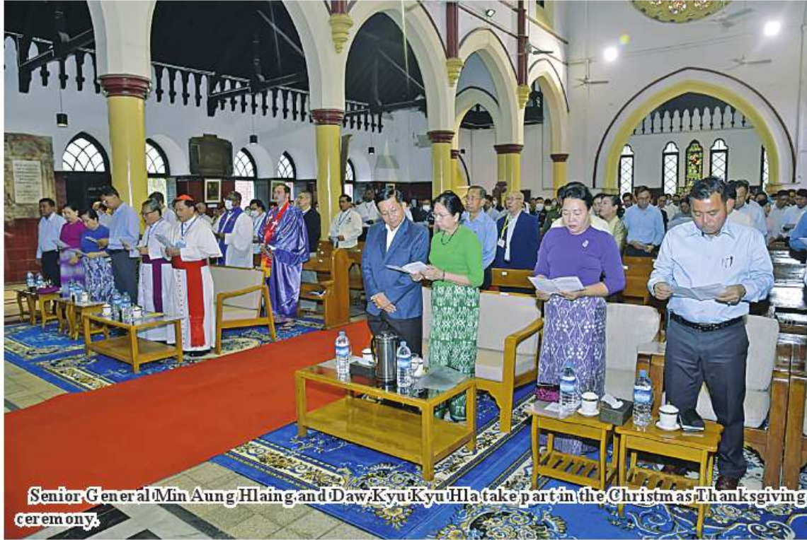
Senior General Min Aung Hlaing and Daw Kyu Kyu Hla take part in the Christmas Thanksgiving ceremony.

Nay Pyi Taw December 23 Myanmar Council of Churches (MCC), Catholic Bishops of Republic of Union of Myanmar, Myanmar Evangelical Christian Alliance, Myanmar Christian Mission Cooperation Organization jointly organized the Christmas Thanksgiving at Holy Cathedral Church at the corner of Bogyoke Aung San Street and Shwedagon Pagoda Road in Pabedan Township, Yangon Region, this evening, attended by Chairman of State Administration Council Prime Minister Senior General Min Aung Hlaing.