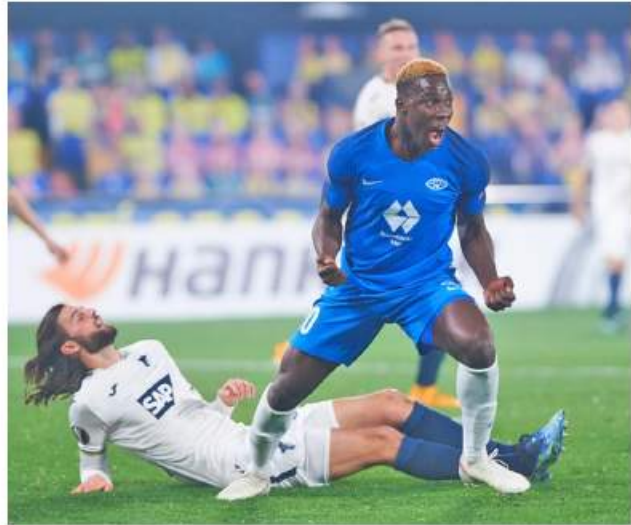
လန်ဒန် ၁၆ ဇူလိုင် ၂၀၂၂ ချွယ်ဆီးအသင်းသည် တိုက်စစ် ပိုင်း လိုအပ်ချက်အတွက် နော်ဝေ