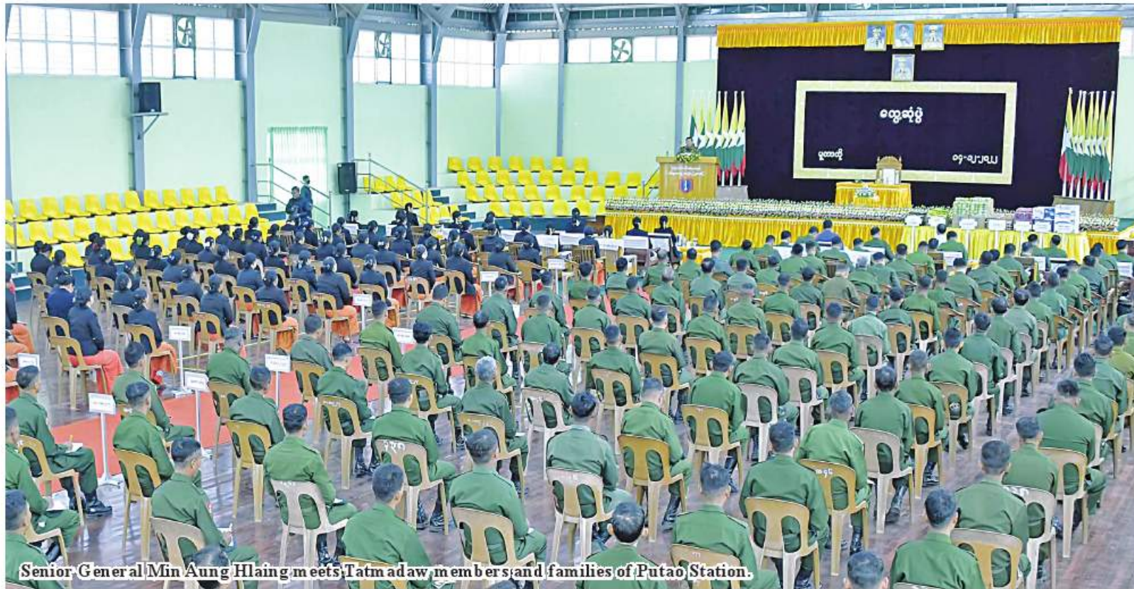
Senior General Min Aung Hlaing meets Tatmadaw members and families of Putao Station.