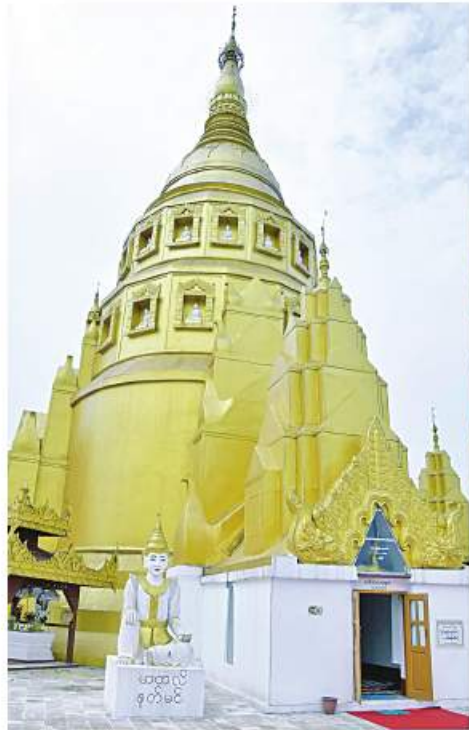
Senior General Min Aung Hlaing pays homage to Kaunghmulon Pagoda.