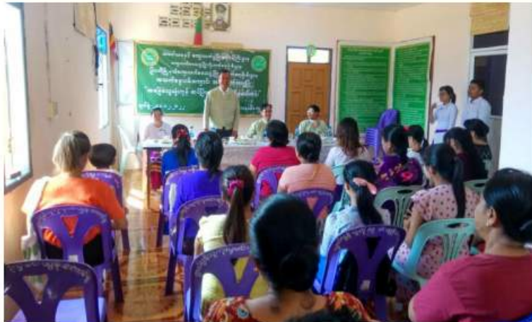
မြဝတီမြို့နယ် ကျေးလက် ဦးစီးမှူး ဦးကျော်သူရထံမှ သိရသည်။ ဒေသဖွံ့ဖြိုးတိုးတက်ရေးဦးစီးဌာန မြို့နယ်

နယ်ပယ်တွင် ပြန်လည်အသုံးပြုစေလိုကြောင်း ပြောကြားသည်။ အဆိုပါသင်တန်းသို့ အပြင်မဲကနယ်ကျေးရွာနှင့် မဲကနယ်တိုးချဲ့တွက်သစ်ကျေးရွာတို့မှ သင်တန်းသူဦးရေ ၂၀ တက်ရောက်ခဲ့ကြပြီး သင်တန်းတွင် ရေချိုးဆပ်ပြာ၊ ပန်းကန်ဆေးဆပ်ပြာ၊ လက်ဆေးဆပ်ပြာနှင့် ဆပ်ပြာအမျိုးမျိုးပြုလုပ်နည်းများကို ကျွမ်းကျင်နည်းပြများက ဒီဇင်ဘာ ၁၃ ရက်မှ ဒီဇင်ဘာ ၁၉ ရက်ထိ စာတွေ့၊ လက်တွေ့ဖြင့် အခမဲ့သင်ကြားပို့ချသွားမည်