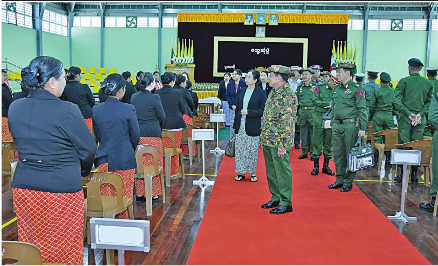
နိုင်ငံတော်စီမံအုပ်ချုပ်ရေးကောင်စီဥက္ကဋ္ဌ တပ်မတော်ကာကွယ်ရေးဦးစီးချုပ် ဗိုလ်ချုပ်မှူးကြီးမင်းအောင်လှိုင်နှင့်ဇနီး ဒေါ်ကြူကြူလှတို့က တက်ရောက်လာကြသည့် အရာရှိ၊ စစ်သည်၊ မိသားစုများအား ရင်းရင်းနှီးနှီးလိုက်လံနှုတ်ဆက်စဉ်။

စာမျက်နှာ ၁၈ မှအဆက် သေသပ်မှုရရှိရန်လိုကြောင်း၊ စစ်စည်းကမ်း ကောင်းမွန်ပြီး အမိန့်နာခံမှုရှိခြင်းသည် စစ်သည်တစ်ဦးချင်း၏ ဘဝအတွက် ကောင်းမွန်သည့် အလေ့အကျင့်တစ်ခုပင် ဖြစ်ကြောင်း၊ မိမိတို့ နေ့စဉ်လုပ်ဆောင် နေရသည့် လုပ်ငန်းစဉ်များကို မှန်မှန် ကန့်ကန့်ဆောင်ရွက်၍ စည်းကမ်း၊ ကျင့်ဝတ်များနှင့်အညီ နေထိုင်လုပ်ကိုင် မည်ဆိုပါက လေ့ကျင့်သော ဖြည့်စွမ်း အရည်အသွေးဖြည့်ဝသည့် စစ်သည်များ ဖြစ်လာမည်ဖြစ်ကြောင်း။