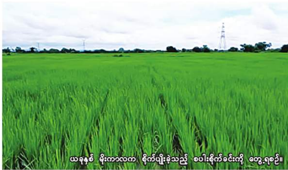
ယခုနှစ် မိုးကာလက စိုက်ပျိုးခဲ့သည့် စပါးစိုက်ခင်းကို တွေ့ရစဉ်။

မော်လိုက် ဒီဇင်ဘာ ၁၄ စစ်ကိုင်းတိုင်းဒေသကြီး မော်လိုက်ခရိုင်တွင် လာမည့် နွေသီးနှံ စိုက်ပျိုးရာသီ၌ နွေစပါး ၉၁၇၉ ဧက လျာထားစိုက်ပျိုးမည်ဖြစ်ကြောင်း မော်လိုက်ခရိုင် စိုက်ပျိုးရေးဦးစီးဌာနမှ သိရသည်။