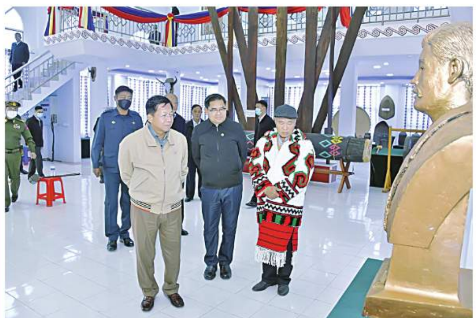
Senior General Min Aung Hlaing visits