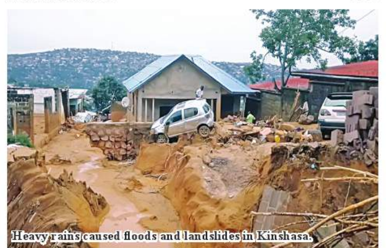
Heavy rains caused floods and landslides in Kinshasa.