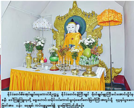
၂) ရေပျံအစောင့် နှစ်ဖက် (ပတ်) ဖြစ်ကမ်းစုံဘေးတွင် တည်ထား ကိုးကွယ်သည့် ရွှေဟောင်းသရိုင်းဝင် ကောင်းမွန်စေတီတော်မြတ်ကြီးသို့ သွားရောက် ပြုစုပြုပြင်ကြည့်ရှုခဲ့သည်။