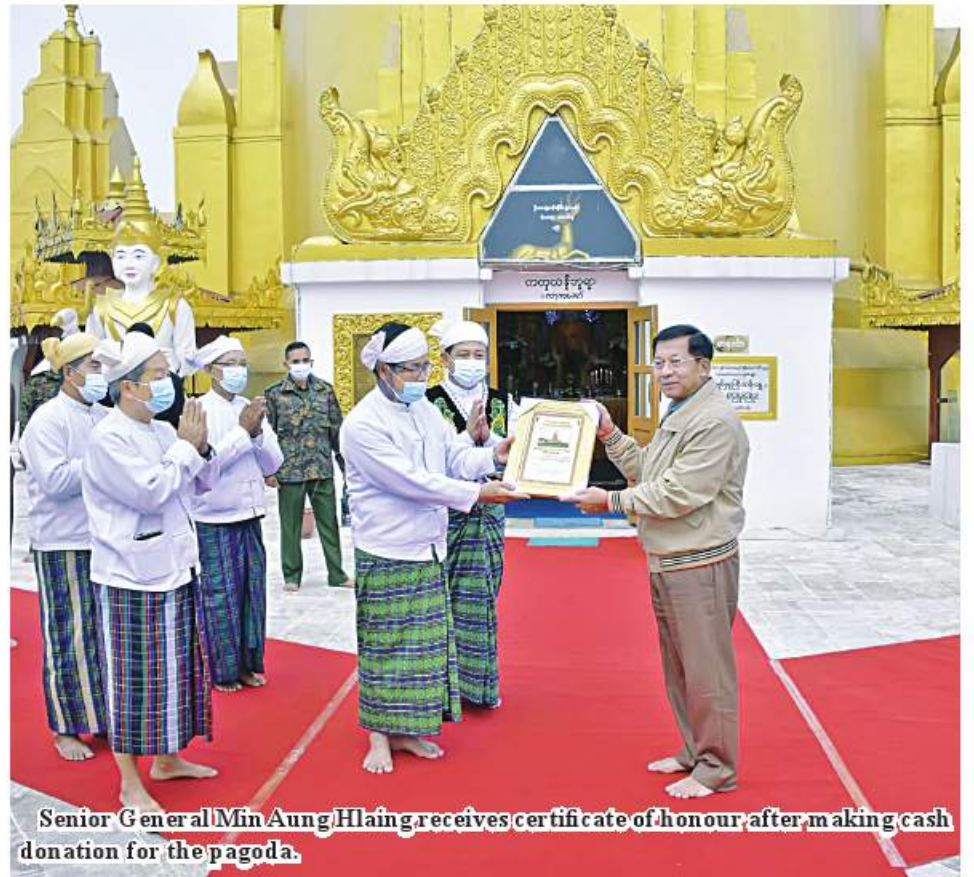
Senior General Min Aung Hlaing receives certificate of honour after making cash donation for the pagoda.

and tallest with the most famous among other pagodas in Khamteelon area, the pagoda is named Saokaunghmulon, identified as the noblest pagoda, according to the records on all-round renovation of the pagoda. At the Rawang Cultural Museum in the Rawang National Park in Duttan Ward of Putao, the Senior General