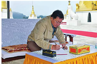
နိုင်ငံတော်စီမံအုပ်ချုပ်ရေးကောင်စီဥက္ကဋ္ဌ နိုင်ငံတော်ဝန်ကြီးချုပ် ခိုင်လုံ၊ ရေပျံအစောင့် နှစ်ဖက် (ပတ်) ဖြစ်ကမ်းစုံဘေးတွင် တည်ထား ကိုးကွယ်သည့် ရွှေဟောင်းသရိုင်းဝင် ကောင်းမွန်စေတီတော်မြတ်ကြီး စည်သူတော် မှတ်တမ်းစာအုပ်တွင် လက်မှတ်ရေးထိုးခဲ့ခြင်း။

နှစ်ဖက်တွင်လည်း “အထက်တွင် ကောင်းမွန်စေတီတော် နှစ်ဖက်ရှိ အလယ် တွင် ရွှေစည်ရံ” ဟု နှစ်ဖက်ဘက်တွင် တည်ရှိလျက်ရှိကြောင်း၊ ကောင်းမွန်စေတီတော်မြတ်ကြီးသည် အလွန်ရှေးကျသော စေတီတော်ကြီးဖြစ်ပြီး တိုင်းဒေသကြီး ရှစ်ဖက်တွင်သာသာကာသာ ကောင်းမွန်စေတီတော်ဟု ခေါ်တွင်ကြောင်း၊ ရွှေစည်ရံမီးစေတီတော်ဟု ခေါ်တွင်ကြောင်း၊ သစ်တီးလုံဒေသရှိ စေတီတော်အားလုံးကို ပုံတော်၏ အမွေအနှစ်အဖြစ်ဖြင့်၊ ညောင်တော်မြင့်ဟုခေါ်ပြီး၊ တန်ခိုးအာနိသေ ဝိနည်းများ ဖြစ်ပေါ်လာခဲ့ကြောင်း (စစ်ကောင်းမှုလုံ) ဖြစ်ပေါ်လာသောစေတီတော် ဟု ခေါ်တွင်ကြောင်း၊ စေတီတော်အားလုံးကို ပုံတော်ဖြင့် မှတ်တမ်းတမ်းများအရ သိရှိရသည်။