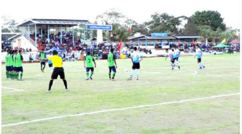
လေးခရိုင် အလွတ်တန်း အမျိုးသား ဘောလုံးပြိုင်ပွဲ ဖွင့်ပွဲအဖြစ် နှစ်စနစ်တပ်နယ် အသင်းနှင့် မိုးနဲမြို့နယ် အသင်းတို့ ယှဉ်ပြိုင် ကစားစဉ်။

နေပြည်တော် ဒီဇင်ဘာ ၁၄ (၇၅)နှစ်မြောက် စိန်ရတုလွတ်လပ်ရေးနေ့ကို ကြိုဆိုဂုဏ်ပြုသောအားဖြင့် ရှမ်းပြည်နယ်(တောင်ပိုင်း) နှစ်စနစ်မြို့တွင် လေးခရိုင် အလွတ်တန်းအမျိုးသားဘောလုံးပြိုင်ပွဲဖွင့်ပွဲကို ယနေ့ညနေပိုင်းတွင် မြို့နယ်အားကစားကွင်း၌ ပြုလုပ်ခဲ့သည်။ အဆိုပါ ဘောလုံးပြိုင်ပွဲကို ရှမ်းပြည်နယ်(တောင်ပိုင်း) ခရိုင် လေးခရိုင်မှ ပြိုင်ပွဲဝင် အသင်း ၁၃ သင်းဖြင့် ၂၀၂၃ ခုနှစ် ဇန်နဝါရီ ၄ ရက်