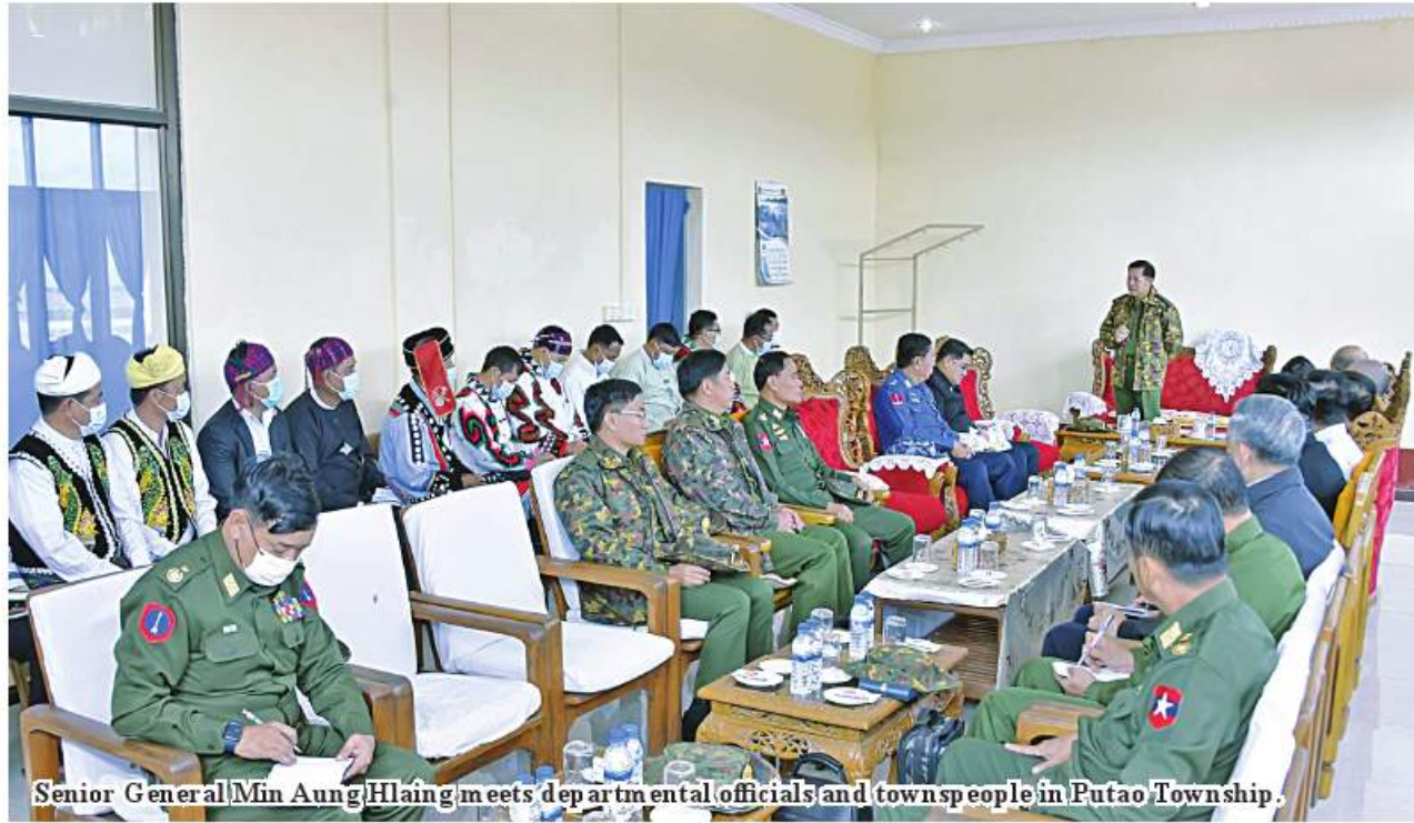
Senior General Min Aung Hlaing meets departmental officials and townspeople in Putao Township.