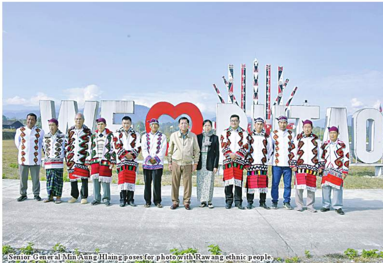
Senior General Min Aung Hlaing poses for photo with Rawang ethnic people.

round renovation of the pagoda to the chairman and members of the pagoda board of trustees who returned the certificate of honour. The pagoda enshrined with three pieces of sacred relic of the Lord Buddha in the reign of King Siri Dhammasoka. Kings in successive eras renovated the pagoda. So, the pagoda is dubbed as "Kaunghmulon in upper, Shwedagon in lower and Shwezigon in centre" by Myanmar Buddhists. Kaunghmulon Pagoda is very ancient, named "Kaungmuusaokankham" traditional weaved equipment, Rawang traditional goda in Taikhamti Shan language. As it is largest