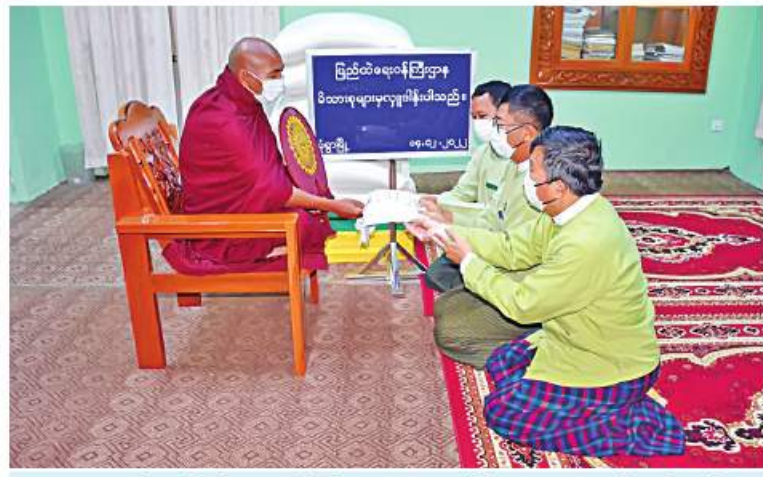
ဆရာတော်ထံ ပြည်ထဲရေးဝန်ကြီးဌာနမှ တာဝန်ရှိသူများက ဆွမ်းဆန်တော်များ ဆက်ကပ်လှူဒါန်းစဉ်။

နေပြည်တော် ဒီဇင်ဘာ ၁၄ ကိုဗစ်-၁၉ ရောဂါ ကြိုတင်ကာကွယ်ရေး လုပ်ငန်းများဆောင်ရွက်နေသည့် ကာလ အတွင်း ဆွမ်းကိစ္စရပ်များ အဆင်ပြေစေရန် ရည်ရွယ်၍ တပ်မတော်(ကြည်း၊ ရေ၊ လေ) အရာရှိ၊ စစ်သည်၊ အရာထမ်း၊ အမှုထမ်း များနှင့် စေတနာရှင်အလှူရှင်များက မြို့နယ်အသီးသီးရှိ ဘုန်းတော်ကြီးကျောင်း များ၊ သာသနာ့ဓနဝင်သီလရှင်ကျောင်း များ၊ ဘာသာရေးကျောင်းများနှင့် ဘိုးဘွား ရိပ်သာများသို့ ဆွမ်းဆန်တော်၊ ဆီ၊ ဆား၊ ပဲ အမည်လေးမျိုးနှင့် လှူဖွယ်ပစ္စည်းများ လှူဒါန်းခြင်း၊ နေဆွမ်းများဆက်ကပ် လှူဒါန်းခြင်းနှင့် လိုအပ်သည့် ကျန်းမာရေး စစ်ဆေးကုသပေးခြင်းများကို ဆောင်ရွက် လျက်ရှိသည်။ ထိုသို့ဆောင်ရွက်လျက်ရှိရာ ယနေ့တွင် ရှမ်းပြည်နယ်(မြောက်ပိုင်း) လောက်ကိုင် မြို့ရှိ မြို့လည်ကျောင်းတိုက်၊ ကွတ်ခိုင်မြို့ရှိ တောင်တန်းဒေသထေရဝါဒ ဗုဒ္ဓသာသနာပြု ဝေယံဘုံသာကျောင်းတိုက်နှင့် တန့်ယန်းမြို့ ရှိ နယ်စပ်ဒေသတောင်တန်းသာသနာပြု ရွှေမောင်းသာသနာပုဏ္ဏ သီလရှင်စာသင် တိုက်၊ ရှမ်းပြည်နယ်(တောင်ပိုင်း) ကွေးသီး မြို့ရှိ လွယ်ပေါ်ဘုန်းတော်ကြီးကျောင်းနှင့် ကွန်တိုင်းမြို့ရှိ အောင်မင်္ဂလာစာသင်တိုက်၊ ဖွန်ပြည်နယ် သထုံမြို့နယ်ရှိ ဘုရားလေး ပရိယတ္တိစာသင်တိုက်၊ ရန်ကုန်တိုင်း ဒေသကြီးအတွင်းရှိ မြို့နယ်များမှ ဘုန်းတော်ကြီးကျောင်း ၁၀ ကျောင်း၊ ဧရာဝတီတိုင်းဒေသကြီး ပုသိမ်မြို့ရှိ မင်္ဂလာစာသင်တိုက်၊ ရခိုင်ပြည်နယ်