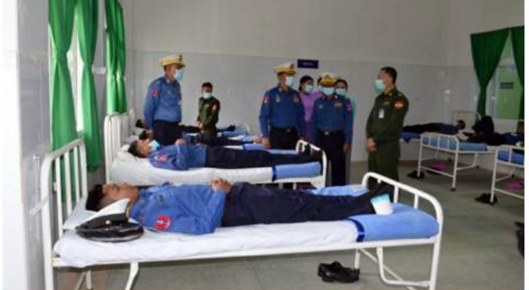
(၇၅)နှစ်မြောက် စိန်ရတုတပ်မတော်(ရေ) နှစ်ပတ်လည်နေ့ကို ကြိုဆိုဂုဏ်ပြုသောအားဖြင့် တပ်မတော်(ရေ)မှ အရာရှိ၊ စစ်သည်များ၊ မိသားစုဝင်များက စုပေါင်းသွေးလျှော့ဒါန်းနေမှုကို တာဝန်ရှိသူများက ကြည့်ရှုအားပေးစဉ်။

ရေတပ်တွင်ကမ္ဘာ့ဌာနချုပ်မှူး ဗိုလ်ချုပ်ထိန်းဝင်းနှင့် တာဝန်ရှိသူများ၊ စုပေါင်းသွေးလျှော့ဒါန်းမည့် အရာရှိ၊ စစ်သည်၊ မိသားစုဝင်များ တက်ရောက်ကြသည်။ ဦးစွာ ကျန်းမာရေးဝန်ထမ်းများက သွေးအလျှင်များကို သွေးလျှော့ဒါန်းနိုင်ရေးအတွက် လိုအပ်သည့်ကျန်းမာရေးစစ်ဆေးခြင်း၊ သွေးပေါင်ချိန်ခြင်း၊ သွေးအုပ်စုခွဲခြားခြင်းများ ဆောင်ရွက်ပေးပြီး စုပေါင်းသွေးလျှော့ဒါန်းကြသည်။ ယင်းသို့ စုပေါင်းသွေးလျှော့ဒါန်းနေမှုများကို တာဝန်ရှိသူများနှင့် အဖွဲ့ဝင်များက လိုက်လံကြည့်ရှုအားပေးခဲ့ကြပြီး သွေးလျှော့ဒါန်းသူများကို အားပေးမှုများ၊ ကြက်ဥနှင့်အာဟာရဖြည့်စွက်စာများ ထောက်ပံ့ပေးခဲ့ကြောင်း သတင်းရရှိသည်။