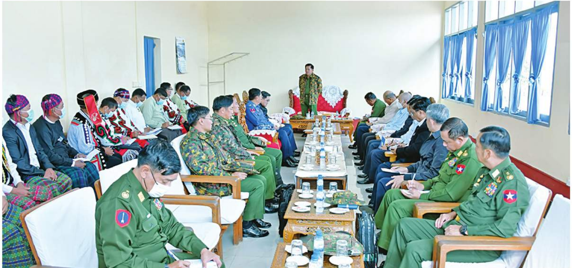
နိုင်ငံတော်စီမံအုပ်ချုပ်ရေးကောင်စီဥက္ကဋ္ဌ နိုင်ငံတော်ဝန်ကြီးချုပ် ဗိုလ်ချုပ်မှူးကြီးမင်းအောင်လှိုင် ပူတာအိုမြို့ရှိ ဌာနဆိုင်ရာတာဝန်ရှိသူများနှင့် မြို့မိမြို့ဖများအား တွေ့ဆုံ၍ ဒေသဖွံ့ဖြိုးတိုးတက်ရေး ဆိုင်ရာများကို ဆွေးနွေးပြောကြားစဉ်။

❖ စိုက်ပျိုးရေးကဏ္ဍဖွံ့ဖြိုးတိုးတက်ရေးအတွက် နိုင်ငံစီးပွားမြှင့်တင်ရေးရန်ပုံငွေများ မတည်ထူထောင်ပေးခဲ့ပြီး ကျန်ရှိသည့်ငွေများမှ MSME လုပ်ငန်းများနှင့် မွေးမြူရေးကဏ္ဍမြှင့်တင်ရေးအတွက် ဆောင်ရွက်ပေးရန် ရည်မှန်းထား... ❖ MSME လုပ်ငန်းများကို မှန်မှန်ကန်ကန်ဖြင့် လက်တွေ့အကောင်အထည်ဖော်ဆောင်ရွက်မည်ဆိုပါက စည်းမျဉ်းစည်းကမ်းများရေးဆွဲ၍ ငွေကြေးများ ချေးငှားပေးရန် အဆင်သင့်ရှိ... (အသေးစား၊ အငယ်စားနှင့် အလတ်စား စီးပွားရေးလုပ်ငန်းများဖွံ့ဖြိုးတိုးတက်ရေး ဗဟိုကော်မတီဥက္ကဋ္ဌ နိုင်ငံတော်စီမံအုပ်ချုပ်ရေးကောင်စီဥက္ကဋ္ဌ နိုင်ငံတော်ဝန်ကြီးချုပ် ဗိုလ်ချုပ်မှူးကြီးမင်းအောင်လှိုင်၏ ၂၀၂၂ ခုနှစ် ဧကန်တင်စာ ၂၃ ရက်တွင် ကျင်းပပြုလုပ်သော ပြည်ထောင်စုသမ္မတမြန်မာနိုင်ငံတော် အသေးစား၊ အငယ်စားနှင့် အလတ်စားစီးပွားရေးလုပ်ငန်းများ ဖွံ့ဖြိုးတိုးတက်ရေးဗဟိုကော်မတီ (၁/၂၀၂၂) အစည်းအဝေးသို့ တက်ရောက်အမှာစကားပြောကြားမှုမှ ကောက်နုတ်ချက်)