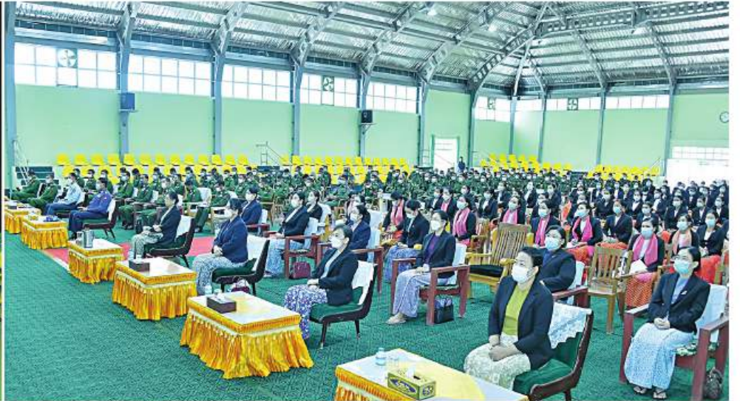
နိုင်ငံတော်စီမံအုပ်ချုပ်ရေးကောင်စီဥက္ကဋ္ဌ တပ်မတော်ကာကွယ်ရေးဦးစီးချုပ် ဝိုင်းချုပ်မှူးကြီးမင်းအောင်လှိုင် မြောက်ပိုင်းတိုင်းစစ်ဌာနချုပ် ပုတာအိုတပ်နယ်မှ အရာရှိ၊ စစ်သည်၊ မိသားစုများကို တွေ့ဆုံအမှာစကားပြောကြားစဉ်။

နေပြည်တော် ၁၄ ဇူလိုင် ဒေသခံတိုင်းရင်းသားများဖြင့် ပါဝင် ဖွဲ့စည်းထားသည့် တပ်များဖြစ်သဖြင့် ဒေသခံများနှင့် တပ်စည်းလုံးညီညွတ်မှု ရှိရမည်ဖြစ်ပြီး စုစည်းစည်းဖြင့် ညီညီ ညွတ်ညွတ်ရှိရမည်ဖြစ်ကြောင်း၊ စုစည်း