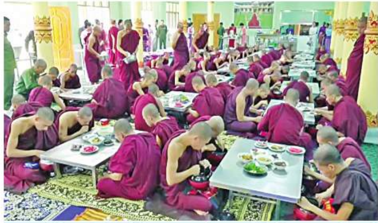
ပဲစူးတိုင်းဒေသကြီး ပြည်မြို့ သာသနာ့ဗဟိုဌာနသင်တိုက်ရှိ သံဃာတော်များကို တာဝန်ရှိသူများက နေဆွမ်းဆက်ကပ်လှူဒါန်းစဉ်။

နေပြည်တော် ဒီဇင်ဘာ ၁၄ ကိုဗစ်-၁၉ ရောဂါ ကြိုတင်ကာကွယ်ရေး လုပ်ငန်းများဆောင်ရွက်နေသည့် ကာလ အတွင်း ဆွမ်းကိစ္စရပ်များ အဆင်ပြေစေရန် ရည်ရွယ်၍ တပ်မတော်(ကြည်း၊ ရေ၊ လေ) အရာရှိ၊ စစ်သည်၊ အရာထမ်း၊ အမှုထမ်း များနှင့် စေတနာရှင်အလှူရှင်များက မြို့နယ်အသီးသီးရှိ ဘုန်းတော်ကြီးကျောင်း များ၊ သာသနာ့ဓနဝင်သီလရှင်ကျောင်း များ၊ ဘာသာရေးကျောင်းများနှင့် ဘိုးဘွား ရိပ်သာများသို့ ဆွမ်းဆန်တော်၊ ဆီ၊ ဆား၊ ပဲ အမည်လေးမျိုးနှင့် လှူဖွယ်ပစ္စည်းများ လှူဒါန်းခြင်း၊ နေဆွမ်းများဆက်ကပ် လှူဒါန်းခြင်းနှင့် လိုအပ်သည့် ကျန်းမာရေး စစ်ဆေးကုသပေးခြင်းများကို ဆောင်ရွက် လျက်ရှိသည်။ ထိုသို့ဆောင်ရွက်လျက်ရှိရာ ယနေ့တွင် ရှမ်းပြည်နယ်(မြောက်ပိုင်း) လောက်ကိုင် မြို့ရှိ မြို့လည်ကျောင်းတိုက်၊ ကွတ်ခိုင်မြို့ရှိ တောင်တန်းဒေသထေရဝါဒ ဗုဒ္ဓသာသနာပြု ဝေယံဘုံသာကျောင်းတိုက်နှင့် တန့်ယန်းမြို့ ရှိ နယ်စပ်ဒေသတောင်တန်းသာသနာပြု ရွှေမောင်းသာသနာပုဏ္ဏ သီလရှင်စာသင် တိုက်၊ ရှမ်းပြည်နယ်(တောင်ပိုင်း) ကွေးသီး မြို့ရှိ လွယ်ပေါ်ဘုန်းတော်ကြီးကျောင်းနှင့် ကွန်တိုင်းမြို့ရှိ အောင်မင်္ဂလာစာသင်တိုက်၊ ဖွန်ပြည်နယ် သထုံမြို့နယ်ရှိ ဘုရားလေး ပရိယတ္တိစာသင်တိုက်၊ ရန်ကုန်တိုင်း ဒေသကြီးအတွင်းရှိ မြို့နယ်များမှ ဘုန်းတော်ကြီးကျောင်း ၁၀ ကျောင်း၊ ဧရာဝတီတိုင်းဒေသကြီး ပုသိမ်မြို့ရှိ မင်္ဂလာစာသင်တိုက်၊ ရခိုင်ပြည်နယ်