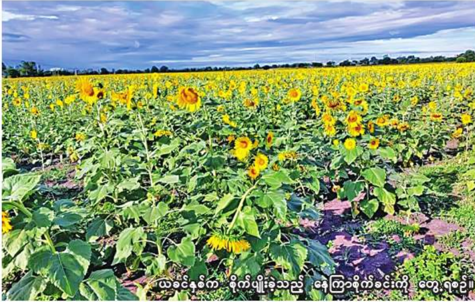
ယခင်နှစ်က စိုက်ပျိုးခဲ့သည့် နေကြာစိုက်ခင်းကို တွေ့ရစဉ်။