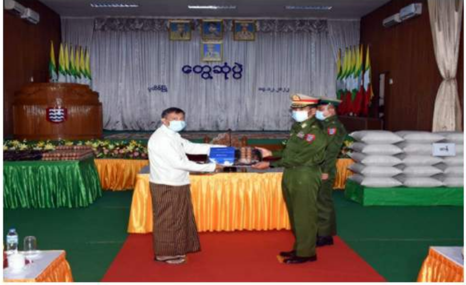
အနောက်တောင်တိုင်း စစ်ဌာနချုပ် တိုင်းမှူး ဗိုလ်မှူးချုပ်ကြည်ရိုင် စစ်မှုထမ်းဟောင်းအဖွဲ့ဝင်များနှင့် မိသားစုဝင်များအတွက် ဆန်၊ ဆီ၊ ဆား၊ ပဲ အမည်လေးမျိုးနှင့် စားသောက်ဖွယ်ရာများ ပေးအပ်စဉ်။

များ၏တင်ပြချက်များအပေါ် ညှိနှိုင်းဖြည့်ဆည်းဆောင်ရွက်ပေးကြပြီး စစ်မှုထမ်းဟောင်းအဖွဲ့ဝင်များနှင့် မိသားစုဝင်များအတွက် ဆန်၊ ဆီ၊ ဆား၊ ပဲ အမည်လေးမျိုးနှင့် စားသောက်ဖွယ်ရာများ ပေးအပ်ရာ တာဝန်ရှိသူများက လက်ခံရယူခဲ့ကြသည်။ ယင်းနောက် စစ်မှုထမ်းဟောင်းအဖွဲ့ဝင်များနှင့် မိသားစုဝင်များအား နယ်မြေခံဆေးအဖွဲ့များက လိုအပ်သည့် ကျန်းမာရေးစစ်ဆေးပေးခြင်းများ ဆောင်ရွက်နေမှုများကို တိုင်းမှူးများနှင့် တာဝန်ရှိသူများက လိုက်လံကြည့်ရှုအားပေး၍ လိုအပ်သည်များ ဖြည့်ဆည်းဆောင်ရွက်ပေးခဲ့ကြကြောင်း သတင်းရရှိသည်။