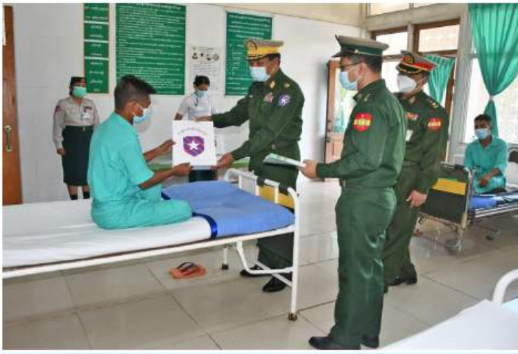
အရှေ့တောင်တိုင်းစစ်ဌာနချုပ် တိုင်းမှူး ဗိုလ်ချုပ်မြတ်သက်ဦး ဆေးရုံတက်လူနာ များကို အာဟာရဖြည့်စားသောက်ဖွယ်ရာများနှင့် ထောက်ပံ့ငွေများပေးအပ်စဉ်။

အသီးသီးမှ တိုင်းမှူးများနှင့် အဖွဲ့ဝင်များက သွားရောက်ကြည့်ရှု၍ တစ်ဦးချင်း၏ ရောဂါဖြစ်ပွားမှု၊ ဆေးကုသပေးထားမှုနှင့် ကျန်းမာရေးတိုးတက်မှုအခြေအနေများကို ရင်းရင်းနှီးနှီး မေးမြန်းအားပေးစကား ပြောကြားပြီး ဆေးရုံတက်လူနာများကို အာဟာရဖြည့်စားသောက်ဖွယ်ရာများနှင့် ထောက်ပံ့ငွေများ ပေးအပ်သည်။ ထို့နောက် တိုင်းမှူးများနှင့် အဖွဲ့ဝင် များသည် ဆေးရုံများအတွင်း လှည့်လည် ကြည့်ရှုပြီး လိုအပ်သည်များ ညှိနှိုင်း ဆောင်ရွက်ပေးခဲ့ကြကြောင်း သတင်း ရရှိသည်။