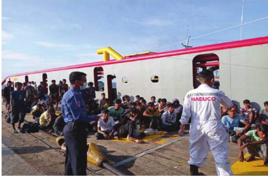
ဘင်္ဂါလီ လူမျိုးများကို HAI DUONG 38 ရေယာဉ်မှ လွှဲပြောင်းပေးနေမှု မှတ်တမ်းဓာတ်ပုံ။