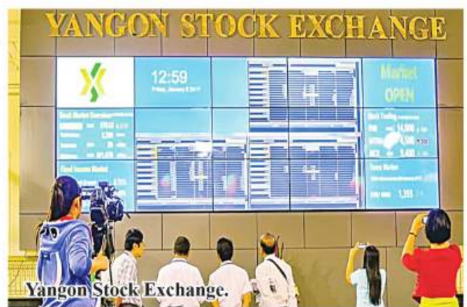
Yangon Stock Exchange.

kyats, totaling 45,974 shares worth 260.35 million kyats. 336