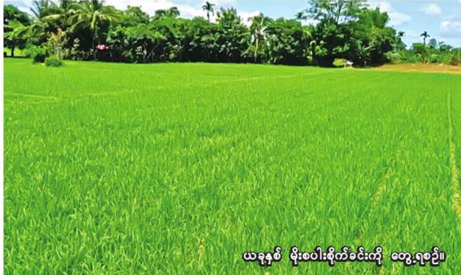
ယခုနှစ် မိုးစပါးစိုက်ခင်းကို တွေ့ရစဉ်။