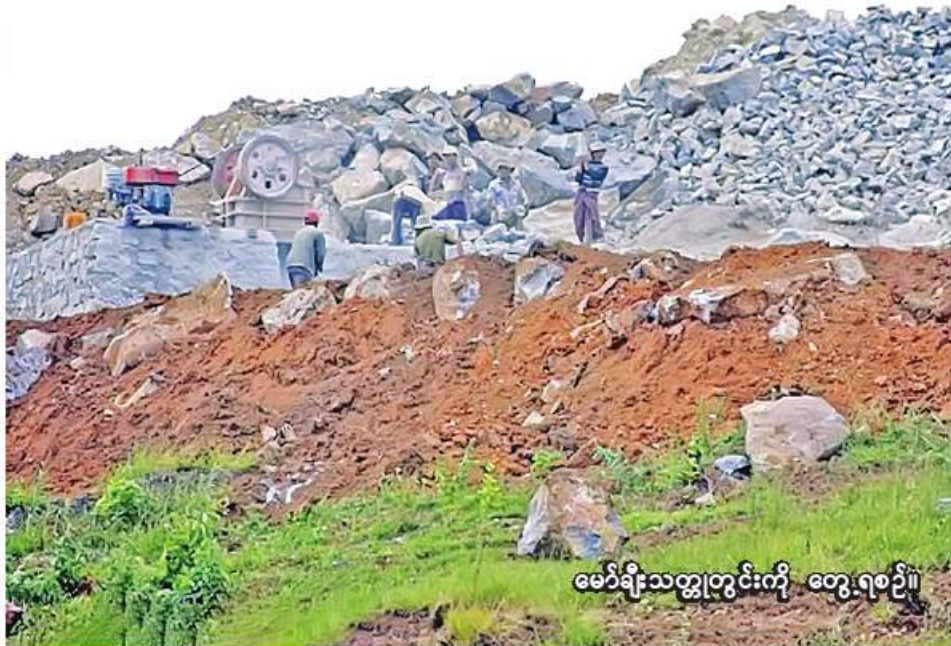
မော်ရီးသတ္တုတွင်းကို တွေ့ရစဉ်။

နေပြည်တော် ဒီဇင်ဘာ ၉ ယခုဘဏ္ဍာနှစ် ပြေ ၁ ရက်မှ နိုဝင်ဘာ ၂၅ ရက်ထိ ကာလအတွင်း သတ္တုတွင်းထွက်ပစ္စည်းတင်ပို့မှုမှ အမေရိကန်ဒေါ်လာ ၂၀၂ ဒသမ ၂၂၆ သန်း ပို့ကုန်ဝင်ငွေရရှိထားကြောင်း စီးပွားရေး