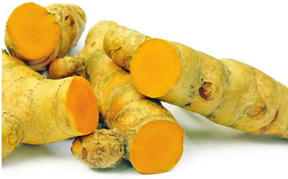
ဆေးပက်ဝင် နန္ဒင်းတက်ကို တွေ့ရစဉ်။

နန္ဒင်း အင်္ဂလိပ်အမည် - Turmeric မျိုးရင်း - Zingiberaceae (ချင်းမျိုးရင်း) ရုက္ခဗေဒအမည် - Curcuma longa Linn.