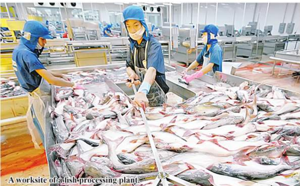
A worksite of a fish processing plant.

Nay Pyi Taw December 9 More than 300 items of marine products are exported from 1 April to 25 November in 2022 of the 2022-23 fiscal year to earn US$473.08 million, said U Nyunt Win,