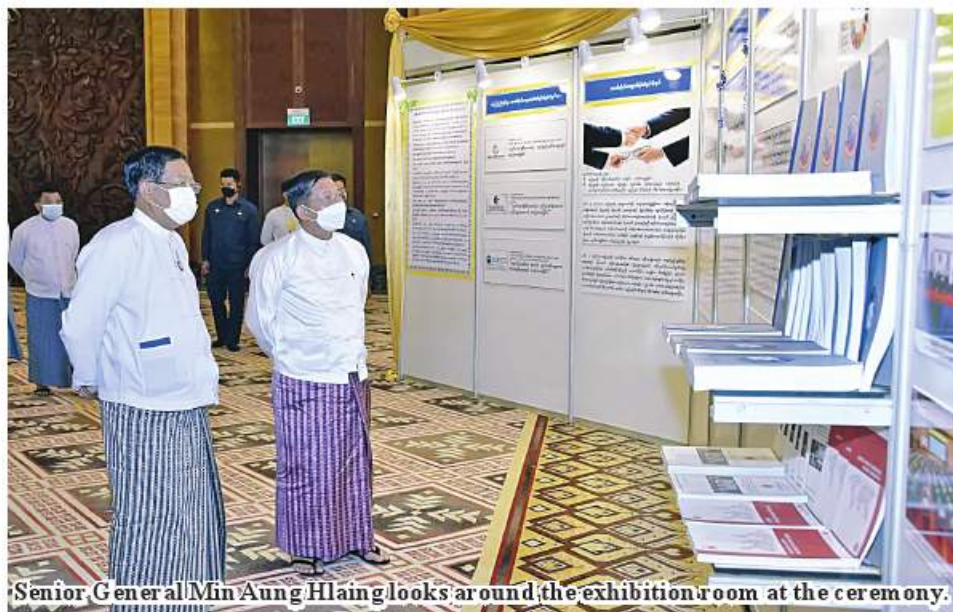
Senior General Min Aung Hlaing looks around the exhibition room at the ceremony.

and good governance, to improve the image and responsibility in public administration and not to affect the rights and interests of the society and citizens.