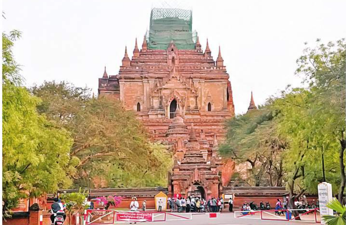
ယခုနှစ် ခရီးသွားရာသီ၌ ပုဂံရှေးဟောင်းယဉ်ကျေးမှုနယ်မြေတွင် ခရီးသွားများ လာရောက်နေမှုကို တွေ့ရစေမည်။

ရန်ကုန် ဒီဇင်ဘာ ၉ ဒီဇင်ဘာနှစ်သစ်ကူးကာလနှင့်ပွဲတော်ကာလတွင် မြန်မာတို့၏ အသည်းနှလုံးဖြစ်သော ပုဂံရှေးဟောင်းယဉ်ကျေးမှုနယ်မြေရှိ ဟိုတယ်များသည် ပြည်တွင်းပြည်ပ ခရီးသွားများကို ဝန်ဆောင်မှုကောင်းများ ပေးနိုင်ရန် အပြိုင်အဆိုင်ကြိုတင်ပြင်ဆင်လျက်ရှိကြောင်း သိရသည်။ ကိုဗစ်-၁၉ ရောဂါကြောင့် မြန်မာ့ယဉ်ကျေးမှုအမွေအနှစ်တို့စုဝေးရာ ပုဂံဒေသတွင် ခရီးသွားလုပ်ငန်းများရပ်နားထားခဲ့ရပြီး ယခုနှစ်၌ နိုင်ငံတော်က ခရီးသွားကဏ္ဍ ဖွံ့ဖြိုးတိုးတက်ရေးကို ပြန်လည်မြှင့်တင်ဆောင်ရွက်ခဲ့ရာ သီတင်းကျွတ်နှင့် တန်ဆောင်တိုင်ပွဲတော်ကာလမှစတင်၍ ဘုရားစေတီများပျက်အင်းလေး၊ ပင်းတယနှင့် အပန်းဖြေစခန်းများတွင် ခရီးသွားများစည်ကားခဲ့ပြီး ဒေသခံတို့၏ စာမျက်နှာ ၁၉ ကော်လံ ၁ ☆