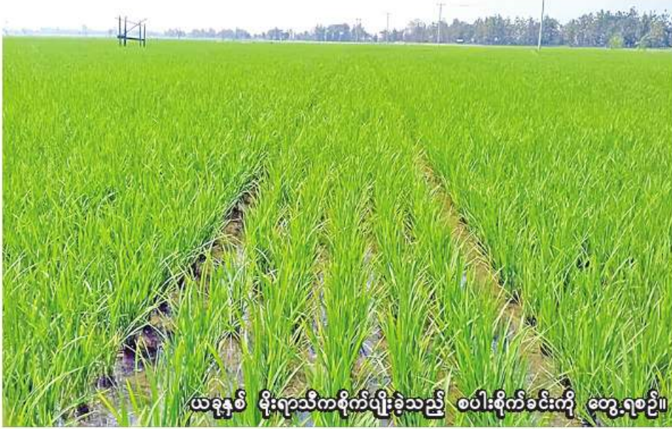
ယခုနှစ် မိုးရာသီကစိုက်ပျိုးခဲ့သည့် စပါးစိုက်ခင်းကို တွေ့ရစဉ်။

ကလေး ဒီဇင်ဘာ ၉ စစ်ကိုင်းတိုင်းဒေသကြီး ကလေးခရိုင်တွင် လာမည့်နွေသီးနှံစိုက်ပျိုးရာသီ၌ စပါး ၃၉၂၄ ဧက စိုက်ပျိုးသွားမည်ဖြစ်ကြောင်း ကလေးခရိုင် စိုက်ပျိုးရေးဦးစီးဌာနမှ သိရသည်။ ယခုနှစ် နွေသီးနှံစိုက်ပျိုးရာသီ၌