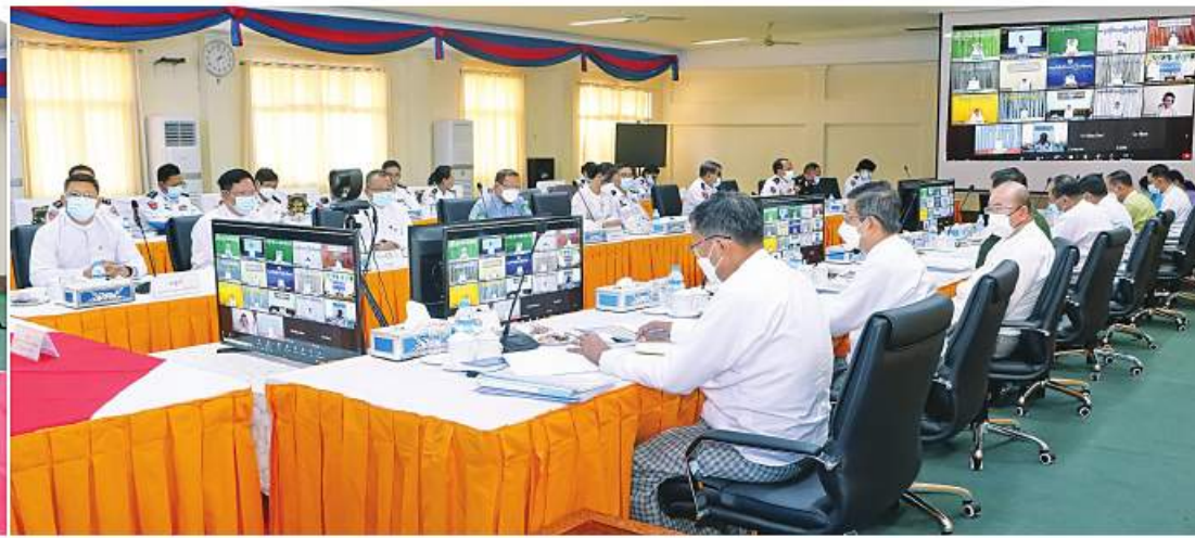
ပြည်ထောင်စုဝန်ကြီး ဦးမြင့်ကြိုင် လူဦးရေစာရင်းမှန်ကန်ရေး မြေပြင်ကွင်းဆင်းတိုက်ဆိုင်စစ်ဆေးရန်အတွက် ဖွဲ့စည်းထားသည့် မြေပြင်ကွင်းဆင်းစာရင်း ကောက်ယူရေးကြီးကြပ်မှုဗဟိုကော်မတီ လုပ်ငန်းညှိနှိုင်းအစည်းအဝေး(၁/၂၀၂၂)တွင် အမှာစကားပြောကြားစဉ်။

နေပြည်တော် ၁၆ ဇူလိုင် လူဦးရေစာရင်းမှန်ကန်ရေး မြေပြင်ကွင်းဆင်း တိုက်ဆိုင်စစ်ဆေးရန်အတွက် ဖွဲ့စည်းထားသည့် မြေပြင်ကွင်းဆင်းစာရင်း ကောက်ယူရေးကြီးကြပ်မှု ဗဟိုကော်မတီ လုပ်ငန်းညှိနှိုင်းအစည်းအဝေး(၁/၂၀၂၂) ကို ယနေ့မနက် ၉ နာရီက နေပြည်တော်ရှိ လူဝင်မှုကြီးကြပ်ရေးနှင့် ပြည်သူ့အင်အား ဝန်ကြီးဌာန အစည်းအဝေးခန်းမ၌ ကျင်းပသည်။ ဦးစွာ မြေပြင်ကွင်းဆင်းစာရင်း ကောက်ယူရေးကြီးကြပ်မှု ဗဟိုကော်မတီ ဥက္ကဋ္ဌ ပြည်ထောင်စုဝန်ကြီး ဦးမြင့်ကြိုင်က နိုင်ငံတော်အစိုးရအနေဖြင့် ရှေ့လုပ်ငန်းစဉ် (၅)ရပ်အနက် အရေးကြီးဆုံးလုပ်ငန်းစဉ် ဖြစ်သည့် လွတ်လပ်ပြီးတရားမျှတသည့် ပါတီစုံဒီမိုကရေစီအထွေထွေရွေးကောက်ပွဲ ကျင်းပပြီး အနိုင်ရပါတီကိုဒီမိုကရေစီစံနှုန်း