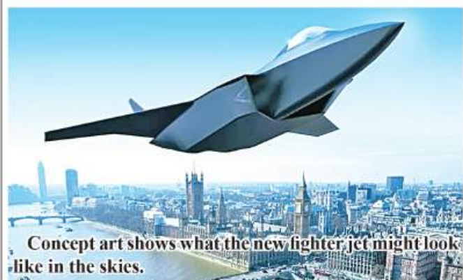
Concept art shows what the new fighter jet might look like in the skies.