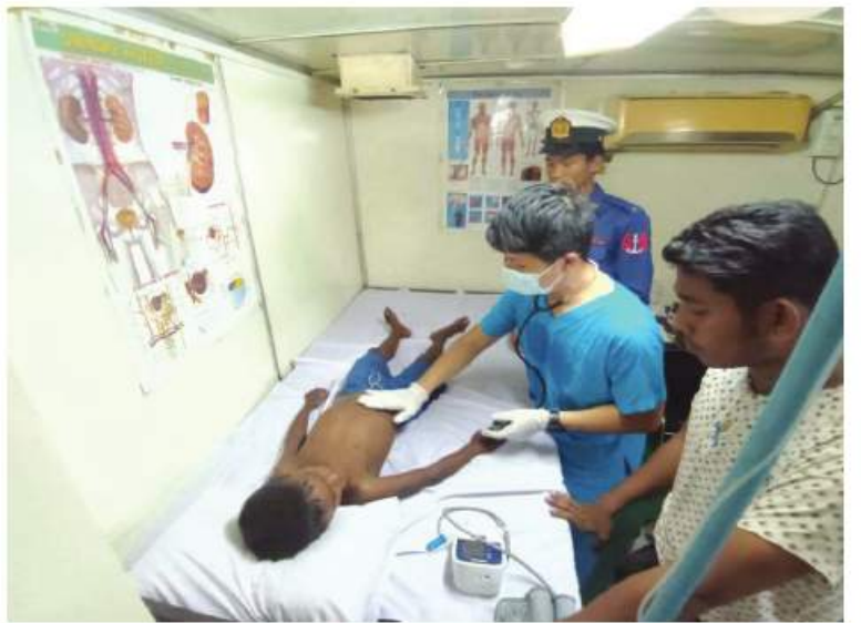
ဘင်္ဂါလီလူမျိုးများကို ဆေးကုသပေးနေမှု မှတ်တမ်းဓာတ်ပုံ။

နေပြည်တော် ၃ ဇူလိုင် ၂၀၂၂ မြန်မာ့ရေနှင့် သဘာဝဓာတ်ငွေ့ လုပ်ငန်း၏ ရေနံရှာဖွေရေးဖော်ရေးလုပ်ငန်းများတွင် အကျိုးတူပေးပေါင်းဆောင်ရွက်လျက်ရှိသော PTTEP International Limited မှ အထောက်အကူပြုရေယာဉ်များဖြစ်သည့် HAI DUONG ၂၅ နှင့် HAI DUONG 38 ရေယာဉ်တို့သည် ဇာတိကစီမံကိန်းကမ်းလှန်လုပ်ကွက်၌ လုပ်ငန်းများဆောင်ရွက်ရန် မြန်မာနိုင်ငံရေပြင်အတွင်း ဖြတ်သန်းလာစဉ် ၃ ဇူလိုင် ၂၀၂၂ ခုနှစ် ဇူလိုင် ၂၅ ရက် နံနက် ၅ နာရီ ၄၅ မိနစ်ခန့်တွင် မြိတ်မြို့၏ အနောက်တောင်ဘက် ၁၅၅ မိုင်ခန့်အကွာသို့အရောက်၌ ဘင်္ဂါလီလူမျိုးများတင်ဆောင်လာသည့် လှေတစ်စီးသည် ရေဝင်၍ နစ်မြုပ်လုနီးပါးဖြစ်နေသည်ကို တွေ့ရှိရသဖြင့် ကယ်ဆယ်ရေးအဖွဲ့အစည်းတစ်ဖွဲ့ (ရေ)မှ လုံခြုံရေးစစ်ရေယာဉ်များသို့ သတင်းပေးပို့လာခဲ့သည်။ သတင်းရလျှင်ရချင်း တပ်မတော်(ရေ)မှ လူသားချင်းစာနာထောက်ထားမှုဆိုင်ရာ လုပ်ငန်းများ ဆောင်ရွက်နိုင်ရန်အတွက်