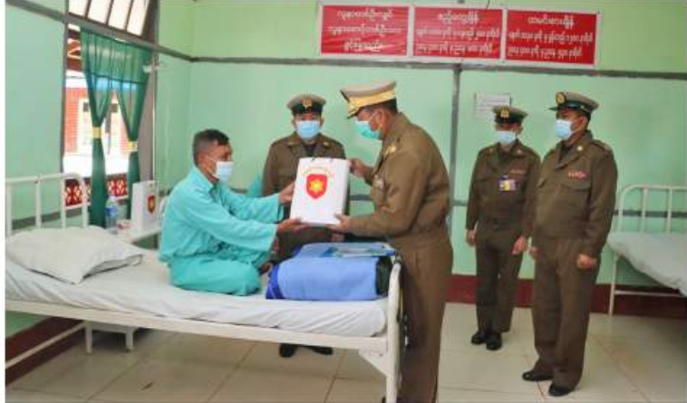
အရှေ့မြောက်တိုင်းစစ်ဌာနချုပ် တိုင်းမှူး ဗိုလ်ချုပ်ခိုင်နိုင်ဦး ဆေးရုံတက်လူနာ များကို အာဟာရဖြည့်စားသောက်ဖွယ်ရာများနှင့် ထောက်ပံ့ငွေများ ပေးအပ်စဉ်။

နေပြည်တော် ဒီဇင်ဘာ ၉ ရှမ်းပြည်နယ်(မြောက်ပိုင်း) လားရှိုးမြို့ ရှိ နယ်မြေခံတပ်မတော်ဆေးရုံ ရှမ်းပြည်နယ် (တောင်ပိုင်း) နှင့်စစ်မြို့ရှိ နယ်မြေခံ ဆေးတပ်ရင်း၊ မွန်ပြည်နယ် မော်လမြိုင်မြို့ ရှိ နယ်မြေခံတပ်မတော်ဆေးရုံ၊ ဧရာဝတီ တိုင်းဒေသကြီး ပုသိမ်မြို့ရှိ နယ်မြေခံဆေး တပ်ရင်း၊ စစ်ကိုင်းတိုင်းဒေသကြီး မုံရွာမြို့ရှိ တပ်မတော်ဆေးရုံတို့၌ တက်ရောက် ကုသမှုခံယူလျက်ရှိသော အရာရှိ၊ စစ်သည်၊ မိသားစုများ၊ စစ်မှုထမ်းဟောင်းအဖွဲ့ဝင် များနှင့် ဗီယက်အစိုးရများ ပြည်သူ့စစ်(ဌာန) တပ်ဖွဲ့ဝင်များနှင့် ဒေသခံပြည်သူများကို ယနေ့တွင် သက်ဆိုင်ရာတိုင်းစစ်ဌာနချုပ်