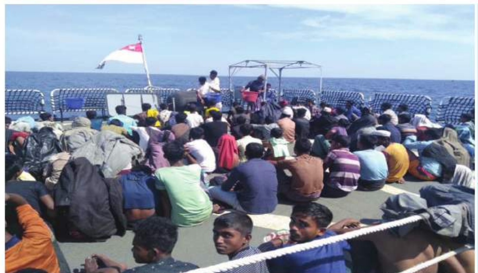
ဘင်္ဂါလီ လူမျိုးများကို စစ်ရေယာဉ်ဖြင့် လွှဲပြောင်း ကယ်ဆယ်လာမှု မှတ်တမ်းဓာတ်ပုံ။

ကော်ဗက်အမျိုးအစား စစ်ရေယာဉ်ကို စေလွှတ်ခေါ်ဆောင်စေခဲ့ရာ ည ၁၀ နာရီခန့်တွင် မြိတ်မြို့၏အနောက်တောင်ဘက် ၁၅၅ မိုင်ခန့်အကွာ၌ HAI DUONG 38 ရေယာဉ်နှင့်တွေ့ဆုံခဲ့ပြီး ဘင်္ဂါလီလူမျိုး လူကြီးကျား ၈၃ ဦး၊ မ ဦးရေ ၄၀၊ ကလေး ကျား ၂၃ ဦး၊ မ ချစ်ဦး စုစုပေါင်း ၁၅၄ ဦးတို့ကို စစ်ရေယာဉ်ပေါ်သို့ လွှဲပြောင်းတင်ဆောင်၍ လိုအပ်သောကျန်းမာရေးစောင့်ရှောက်မှုများဆောင်ရွက်ပြီး အစားအသောက်များ ထောက်ပံ့ကွေးမွေးခေါ်ဆောင်လာခဲ့သည်။ အထက်ပါ ဘင်္ဂါလီလူမျိုးများကို မြိတ်မြို့ အနောက်မြောက်ဘက် ၈ ဒသမ ၅ မိုင်ခန့်အကွာတွင် ကျောက်ချရပ်နား၍ မြိတ်မြို့နယ် လူဝင်မှုကြီးကြပ်ရေးဦးစီးဌာန ပါဝင်သော အဖွဲ့စုံဖြင့် ရေယာဉ်ပေါ်၌ စစ်ဆေးမှုများ ဆက်လက်ဆောင်ရွက်သွားမည်ဖြစ်သည်။ အဆိုပါဘင်္ဂါလီလူမျိုးများသည် ဘင်္ဂါလီ စကားတစ်မျိုးတည်းသာ ပြောဆိုတတ်ပြီး ကနဦးမေးမြန်းချက်အရ ၎င်းတို့သည် ဘင်္ဂလားဒေ့ရှ်နိုင်ငံ ကော့ဘလားခရိုင်