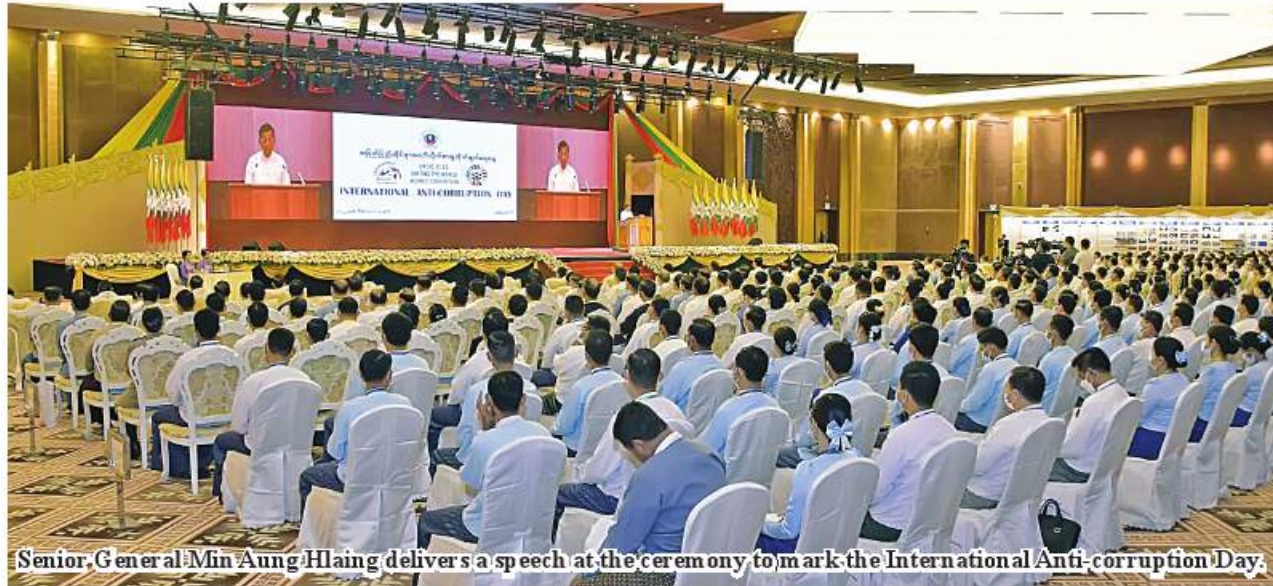
Senior General Min Aung Hlaing delivers a speech at the ceremony to mark the International Anti-corruption Day.

Nay Pyi Taw December 9 Chairman of State Administration Council Prime Minister Senior General Min Aung Hlaing delivered a speech at the ceremony to mark the International Anti-corruption Day, held at the Myanmar International Convention Centre-1 in Nay Pyi Taw this morning.