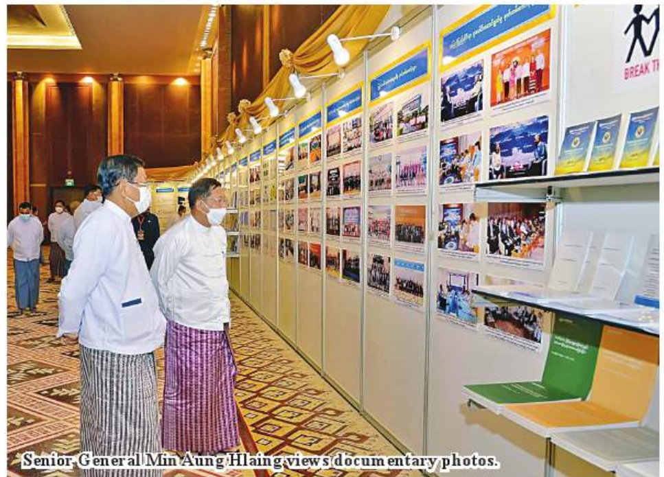
Senior General Min Aung Hlaing views documentary photos.

The more the graft is, the more the poverty is. The more poverty there is, the more the graft is. Thus, the Anti-Corruption Strategic Plan (2022-2025) was laid down and being implemented. Such a strategic action plan is drawn to harmoniously combine and take three anti-graft measures - prevention, education, and action. The national objective of the State Administration Council is to ensure