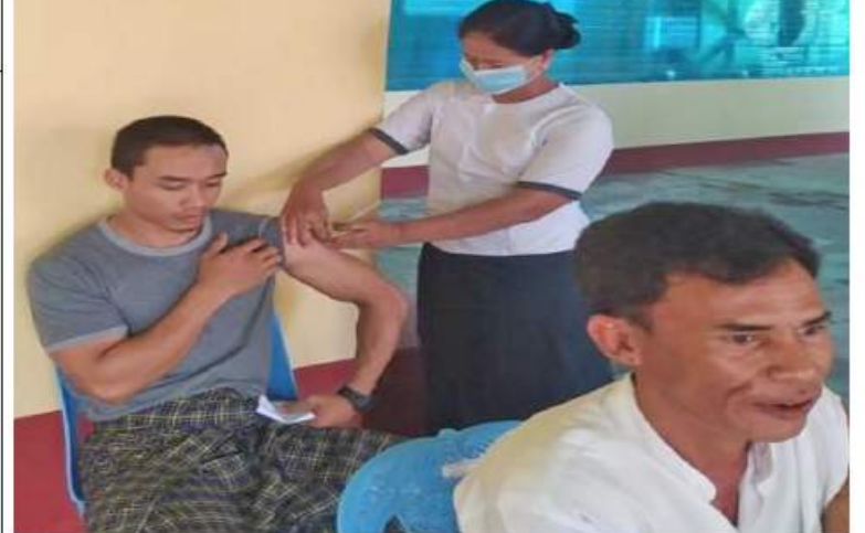
ဧရာဝတီတိုင်းဒေသကြီး ဟင်္သာတမြို့နယ်အတွင်းရှိ ဒေသခံပြည်သူများကို ကိုဗစ်-၁၉ ရောဂါ ကာကွယ်ဆေးများ ထိုးနှံပေးစဉ်။