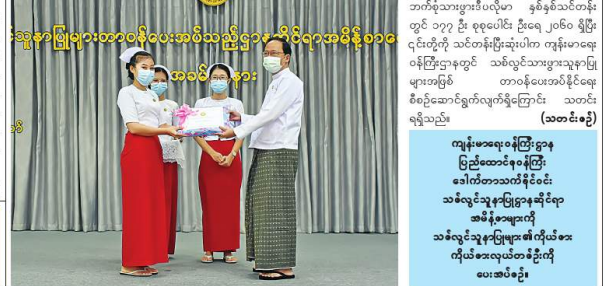
ကျန်းမာရေးဝန်ကြီးဌာန ပြည်ထောင်စုဝန်ကြီး ဝိုင်းချုပ်ကြီးတင်အောင်စန်းက ကျန်းမာရေးဝန်ကြီးဌာန၏ သစ်လွင်သူနာပြုပစ္စည်းအဖြစ် တာဝန်ပေးအပ်ခဲ့ခြင်း

ပြည်ထောင်စုဝန်ကြီး ဝိုင်းချုပ်ကြီးတင်အောင်စန်းက ကျန်းမာရေးဝန်ကြီးဌာန၏ သစ်လွင် သူနာပြုသားများအား လိုလားအောင်မြင်သူ ၁၅၇ ဦးအပါအဝင် သူနာပြုပစ္စည်း ၄၂ ဦး စုစုပေါင်း ၈၀၅ ဦးတို့ကို သစ်လွင်သူနာပြုပစ္စည်းအဖြစ် တာဝန်ပေးအပ်ခဲ့ခြင်းဖြစ်ကြောင်း သိရသည်။