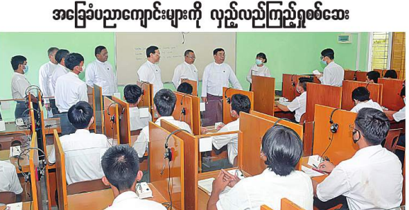
ပညာရေးဝန်ကြီးဌာန ပြည်ထောင်စုဝန်ကြီး ဒေါက်တာညွန့်လွင် အခြေခံပညာကျောင်းများတွင် Language Lab အခန်းနှင့် Grade-9 ကျောင်းသား၊ ကျောင်းသူများ၏ သင်ကြားသင်ယူနေမှုများကို လှည့်လည်ကြည့်ရှုခဲ့ခြင်း

နေပြည်တော် ၇ ဇူလိုင် ၂၀၂၂ ပညာရေးဝန်ကြီးဌာန ပြည်ထောင်စုဝန်ကြီး ဒေါက်တာညွန့်လွင်သည် တာဝန်ခံရရှိသူများနှင့်အတူ ယနေ့ နံနက် ၉ နာရီတွင် ရန်ကင်းအရပ်ပိုင်းတက္ကသိုလ်၊ သာယာဝတီကျန်းမာရေးပညာရေးဒီဂရီကောလိပ်နှင့် အခြေခံပညာကျောင်းများကို လှည့်လည်ကြည့်ရှုစစ်ဆေးခဲ့ကြောင်း သိရသည်။