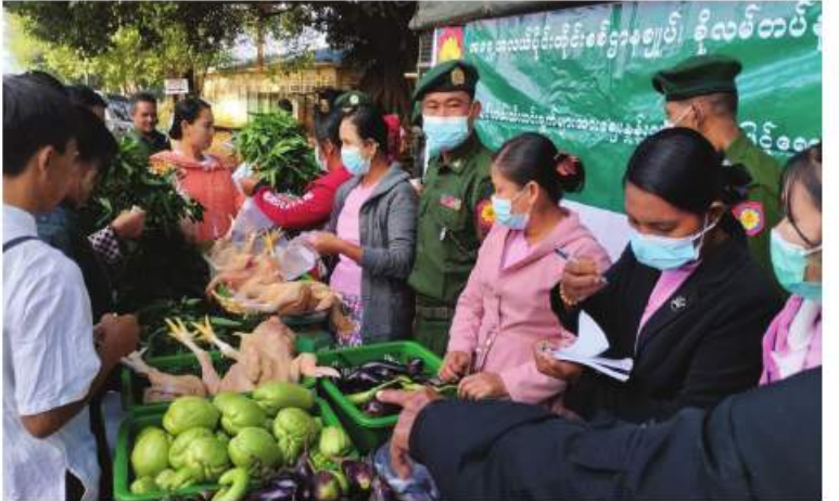
အရှေ့အလယ်ပိုင်းတိုင်းစစ်ဌာနချုပ်မှ နယ်မြေခံတပ်မတော်သားများက ဒေသခံ ပြည်သူများကို ဆန်၊ ဆီ၊ ဆား၊ ကြက်ဥ၊ ဟင်းသီးဟင်းရွက်များနှင့် စားသောက်ကုန်ပစ္စည်းများကို သက်သာသောဈေးနှုန်းများဖြင့် ရောင်းချပေးစဉ်။

စားသောက်ကုန်ပစ္စည်းများကို ပြင်ပပေါက် များဖြင့် ရောင်းချပေးခဲ့ကြောင်း သတင်းစူးထက် သက်သာသောဈေးနှုန်း ရရှိသည်။