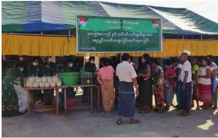
ကမ်းရိုးတန်းဒေသတိုင်းစစ်ဌာနချုပ်မှ နယ်မြေခံတပ်မတော်သားများက ဒေသခံ ပြည်သူများကို ဆန်၊ ဆီ၊ ဆား၊ ကြက်ဥ၊ ဟင်းသီးဟင်းရွက်များနှင့် စားသောက်ကုန်ပစ္စည်းများကို သက်သာသောဈေးနှုန်းများဖြင့် ရောင်းချပေးစဉ်။

နေပြည်တော် ဒီဇင်ဘာ ၇ ကိုဗစ်-၁၉ ရောဂါကာကွယ်ရေးလုပ်ငန်းများဆောင်ရွက်နေသည့် ကာလအတွင်း ဒေသတွင်းစားနပ်ရိက္ခာဖူလုံရေးစစ်မှုထမ်းဟောင်းအဖွဲ့ဝင်များဌာနဆိုင်ရာဝန်ထမ်းများနှင့်ဒေသခံပြည်သူများ စားသောက်ရေးအထောက်အကူဖြစ်စေရန် ရည်ရွယ်၍ တိုင်းစစ်ဌာနချုပ်နယ်မြေများရှိ မြို့နယ်အသီးသီး၌ နယ်မြေခံတပ်မတော်သားများက တန်ဖိုးသင့်ထမင်းဟင်းများ၊ ဟင်းသီးဟင်းရွက်များနှင့် တပ်မတော်စက်ရုံထုတ်အသား၊ ငါးဘူးများနှင့် စားသောက်ကုန်ပစ္စည်းများကို ရောင်းချပေးလျက်ရှိသည်။ ထိုသို့ရောင်းချပေးလျက်ရှိရာ ဒီဇင်ဘာ ၆ ရက်နှင့် ယနေ့တို့တွင် ရှမ်းပြည်နယ်