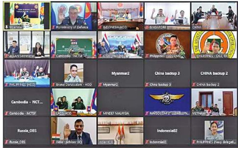
အာဆီယံအပေါင်း အကြမ်းဖက်မှုတန်ပြန်တိုက်ဖျက်ရေးဆိုင်ရာ ကျွမ်းကျင်လုပ်ငန်းအဖွဲ့၏ ဒုတိယအကြိမ်စီမံကိန်းရေးဆွဲရေးအစည်းအဝေး(Middle Planning Conference) ကို Video Teleconferencing (VTC)စနစ်ဖြင့် ကျင်းပစဉ်။

နေပြည်တော် ဒီဇင်ဘာ ၇ - မြန်မာ-ရုရှား ပူးတွဲဥက္ကဋ္ဌအဖြစ် တာဝန်ယူဆောင်ရွက်လျက်ရှိသော အာဆီယံအပေါင်း အကြမ်းဖက်မှုတန်ပြန်တိုက်ဖျက်ရေးဆိုင်ရာ ကျွမ်းကျင်လုပ်ငန်းအဖွဲ့၏ ဒုတိယအကြိမ် စီမံကိန်းရေးဆွဲရေးအစည်းအဝေး (Middle Planning Conference) ကို ဒီဇင်ဘာ ၆ ရက်မှ ၇ ရက်ထိ Video Teleconferencing (VTC) စနစ်ဖြင့် မြန်မာနိုင်ငံက အိမ်ရှင်အဖြစ် ဦးဆောင်ကျင်းပခဲ့သည်။ အစည်းအဝေးတွင် အာဆီယံအပေါင်းအကြမ်းဖက်မှု တန်ပြန်တိုက်ဖျက်ရေးဆိုင်ရာ ကျွမ်းကျင်လုပ်ငန်းအဖွဲ့၏ ပူးတွဲဥက္ကဋ္ဌအဖြစ် တာဝန်ယူထားသော ကာကွယ်ရေးဦးစီးချုပ်ရုံး(ကြည်း)မှ ဗိုလ်ချုပ်အောင်မျိုးသန့်နှင့် ရုရှားနိုင်ငံမှ ပူးတွဲဥက္ကဋ္ဌ Vice-Admiral Berezovsky D.V တို့က နှုတ်ခွန်းဆက်စကားများပြောကြားပြီး အာဆီယံအပေါင်း အကြမ်းဖက်မှုတန်ပြန်