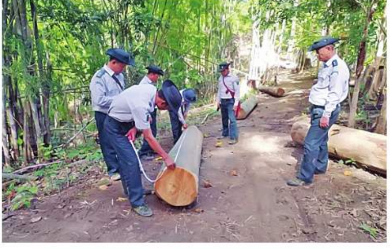
(သတင်းစဉ်)

အဝင် နည်းလမ်းမျိုးစုံဖြင့် အကောင် အထည်ဖော်ဆောင်ရွက်လျက်ရှိရာ နိုဝင်ဘာ ၂၈ ရက်မှ ဒီဇင်ဘာ ၄ ရက်ထိ နေပြည် တော်၊ ပြည်နယ်နှင့် တိုင်းဒေသကြီးရှိ သစ်တောဦးစီးဌာနများက ပေးပို့လာသော စာရင်းများအရ တရားမဝင်ကျွန်း ၄၁ ဒသမ ၅၆၈၆ တန်၊ သစ်မာ ၈ ဒသမ ၆၆၄၈ တန်၊ အခြား ၃၄ ဒသမ ၁၇၈၆ တန် စုစုပေါင်း ၈၄ ဒသမ ၄၁၂၀ တန်၊ ယာဉ်၊ ယန္တရား ၁၁ စီး၊ ပြစ်မှုကျူးလွန်သူ ၂၄ ဦး ဖမ်းဆီးရမိခဲ့ကြောင်း သစ်တောဦးစီးဌာနမှ သတင်းရရှိသည်။