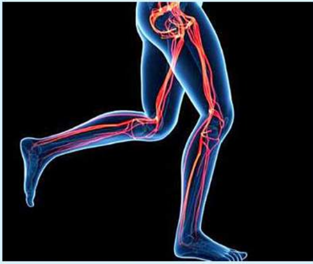
မိမိတို့ရဲ့ ခန္ဓာကိုယ်မှာ ပေါ်လွင်လာပြီး သန်မာလာမှာ အဆီပိုတွေ မရှိတော့ဘူးဆိုရင် ကြွက်သားတွေကလည်း ပိုမို ဖြစ်နိုင်တယ်ဆိုရင်

တော့ တစ်ရက်ကို ခြေလှမ်းရေ ထိရောက်မှုရှိလှပါတယ်။ ၁၀၀၀၀ လောက် လမ်းလျှောက် ပေးရုံနဲ့တင် ရရှိနိုင်ပါတယ်။ ခန္ဓာကိုယ်တစ်လျှောက်မှာရှိတဲ့ ဒီထက်ပိုပြီး ပြင်းထန်တဲ့ လှေကွေးခန်းမျိုးလိုချင်တယ်ဆို ရင်တော့ တောင်တက်လမ်း လျှောက်ခြင်းကိုလည်း ကြိုးစား ကြည့်သင့်ပါတယ်။ ဒါ့အပြင် စတုရန်း ၃၀ မှ ၁ မီနစ် ၂ မိနစ်အထိ ခပ်မြန်မြန်လမ်း လျှောက်ပြီး ပုံမှန်လမ်းပြန် လျှောက်ခြင်း၊ အဲဒီနောက် ခပ် မြန်မြန်ပြန်ပြီး လမ်းလျှောက်ခြင်း လိုမျိုး လှေကွေးခန်းတွေကလည်း စေပါဘူး။