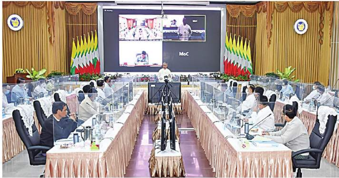
နေပြည်တော် ဒီဇင်ဘာ ၇ - မြန်မာအထူးစီးပွားရေးဇုန်ဆိုင်ရာ ဗဟိုလုပ်ငန်းအဖွဲ့၏ (၄/၂၀၂၂) ကြိမ်မြောက် ညှိနှိုင်းအစည်းအဝေးကို ယနေ့မနန်းလွဲ ၁ နာရီတွင် စီးပွားရေးနှင့် ကူးသန်းရောင်းဝယ်ရေးဝန်ကြီးဌာန အစည်းအဝေးအထူးစီးပွားရေးဇုန်ဆိုင်ရာ ဗဟိုလုပ်ငန်းခန်းမ(၂)၌ ကျင်းပသည်။ ညှိနှိုင်းအစည်းအဝေးတွင် မြန်မာအထူးစီးပွားရေးဇုန်ဆိုင်ရာ ဗဟိုလုပ်ငန်းအဖွဲ့ဝင်များနှင့် အစည်းအဝေးအထူးစီးပွားရေးဇုန်ဆိုင်ရာ ဗဟိုလုပ်ငန်းအဖွဲ့ဝင်များ တက်ရောက်လာကြသည်။

အဖွဲ့ဝင်များ စီးပွားရေးနှင့် ကူးသန်းရောင်းဝယ်ရေးဝန်ကြီးဌာန ပြည်ထောင်စုဝန်ကြီး ဦးအောင်နိုင်ဦးက အထူးစီးပွားရေးဇုန်အလိုက် ဆောင်ရွက်လျက်ရှိသည့် လုပ်ငန်းများ ပိုမိုတိုးတက်မှုရှိစေရေး၊ ဗဟိုအဖွဲ့၏ လမ်းညွှန်ချက်များကို လိုက်နာအကောင်အထည်ဖော်ရေးနှင့် လုပ်ငန်းများအကောင်အထည်ဖော်ရာတွင် အထူးစီးပွားရေးဇုန်ဥပဒေပါ ပြဋ္ဌာန်းချက်များနှင့် အညီဆောင်ရွက်ရေး၊ အထူးစီးပွားရေးဇုန်များ အောင်မြင်စွာဆောင်ရွက်နိုင်ရေးနှင့် ဖွံ့ဖြိုးတိုးတက်ရေးအတွက် သက်ဆိုင်ရာ ဝန်ကြီးဌာနများနှင့် အထူးစီးပွားရေးဇုန်စီမံခန့်ခွဲမှုကော်မတီများက ပူးပေါင်းဆောင်ရွက်ရေးဆိုင်ရာ ကိစ္စရပ်များကို ပြောကြားသည်။ ထို့နောက် အစည်းအဝေးသို့ တက်ရောက်လာကြသည့် မြန်မာအထူးစီးပွားရေးဇုန်ဆိုင်ရာ ဗဟိုလုပ်ငန်းအဖွဲ့ဝင်များ၊ အထူးစီးပွားရေးဇုန်များ၏ စီမံခန့်ခွဲမှုကော်မတီဥက္ကဋ္ဌများနှင့် ဌာနဆိုင်ရာများမှ တာဝန်ရှိသူများက လုပ်ငန်းဆိုင်ရာများကို ပိုင်းဝန်းဆွေးနွေးကြပြီး တင်ပြချက်များအပေါ် ပြည်ထောင်စုဝန်ကြီးက လိုအပ်သည်များ ပေါင်းစပ်ညှိနှိုင်းဆောင်ရွက်ပေးသည်။ အစည်းအဝေးသို့ မြန်မာအထူးစီးပွားရေးဇုန်ဆိုင်ရာ ဗဟိုလုပ်ငန်းအဖွဲ့ ဝန်ကြီးဌာနများနှင့် အဖွဲ့ဝင်များ၊ သီလဝါ၊ ကျောက်ဖြူနှင့် ထားဝယ်အထူးစီးပွားရေးဇုန်စီမံခန့်ခွဲမှုကော်မတီဥက္ကဋ္ဌများ၊ အမြဲတမ်းအတွင်းဝန်၊ ညွှန်ကြားရေးမှူးချုပ်များနှင့် ဌာနဆိုင်ရာအသီးသီးမှ အဆင့်မြင့်အရာရှိကြီးများ တက်ရောက်ခဲ့ကြကြောင်း သတင်းရရှိသည်။ (သတင်းစဉ်)