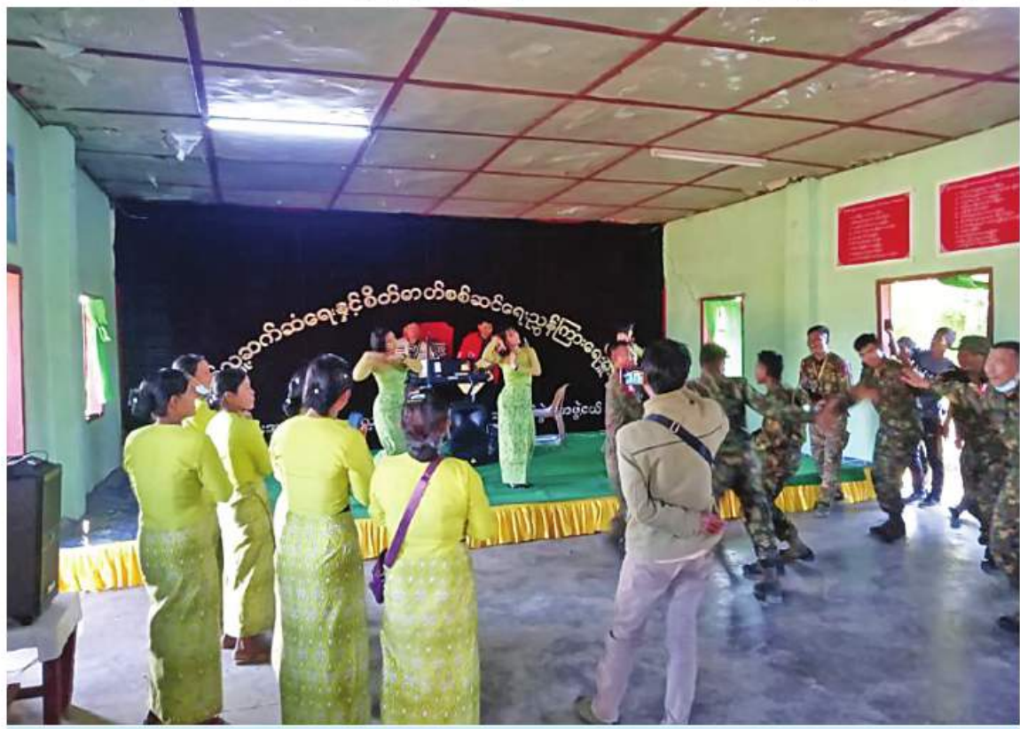
နယ်လှည့်ပြည်သူ့ဆက်ဆံရေးအဖွဲ့ သီဆိုကပြပျော်ဖြေစဉ်။

နေပြည်တော် ဒီဇင်ဘာ ၇ တိုင်းဒေသကြီးနှင့် ပြည်နယ်အသီးသီးရှိ တိုင်းရင်းသားပြည်သူများ စိတ်အေးချမ်းသာစွာ နေထိုင်လုပ်ကိုင်စားသောက်နိုင်ရေးနှင့် အသက်အိုအိမ်စည်းစိမ်စွာလုံခြုံမှုရရှိစေရေး နိုင်ငံတော်ကာကွယ်ရေးနှင့် လုံခြုံရေးတာဝန်များကို မိဝေးဖဝေး၊ မိသားစုများနှင့် ဝေးကွာစွာဖြင့် နေ့မအား ညမနား ထမ်းဆောင်လျက်ရှိသည့် လုံခြုံရေးတပ်ဖွဲ့ဝင်များအနေဖြင့် ၎င်းတို့၏မိသားစုများအပေါ် လွမ်းဆွတ်သတိရသည်စိတ်များ ခေတ္တခဏမျှ ပြေပျောက်စေရန်နှင့်စိတ်ပျော်ရွှင်ကြည်နူးစေရန်အတွက် ကာကွယ်ရေးဦးစီးချုပ်ရုံး(ကြည်း) ပြည်သူ့ဆက်ဆံရေးနှင့် စိတ်ဓာတ်စစ်ဆင်ရေးညွှန်ကြားရေးမှူးရုံးကွပ်ကဲမှုအောက်ရှိ နယ်လှည့်ပြည်သူ့ဆက်ဆံရေးအဖွဲ့များမှ အရာရှိ၊ စစ်သည်၊ စစ်သမီးများနှင့် မြန်မာ့အသံနှင့် ရုပ်မြင်သံကြား(MRTV)မှ