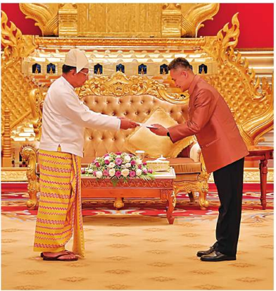
နိုင်ငံတော်စီမံအုပ်ချုပ်ရေးကောင်စီဥက္ကဋ္ဌ နိုင်ငံတော်ဝန်ကြီးချုပ် ခိုင်လုံနှင့် မြန်မာ-ထိုင်းဆက်သွယ်ရေး ဖွံ့ဖြိုးရေးအဖွဲ့ဝင်များ နှစ်နိုင်ငံအဖွဲ့ဝင်များအား နိုင်ငံတော်စီမံအုပ်ချုပ်ရေးကောင်စီဥက္ကဋ္ဌ နိုင်ငံတော်ဝန်ကြီးချုပ် ခိုင်လုံနှင့် ဆုံဆည်းပူးပေါင်းဆွဲနားပြောခဲ့ခြင်း ဖွံ့ဖြိုးရေးအဖွဲ့ဝင်များ နှစ်နိုင်ငံအဖွဲ့ဝင်များအား နိုင်ငံတော်စီမံအုပ်ချုပ်ရေးကောင်စီဥက္ကဋ္ဌ နိုင်ငံတော်ဝန်ကြီးချုပ် ခိုင်လုံနှင့် ဆုံဆည်းပူးပေါင်းဆွဲနားပြောခဲ့ခြင်း

ပု ရွှေသံဃာအသင်း တွေ့ဆုံပွဲအပြီးတွင် နိုင်ငံတော်စီမံအုပ်ချုပ်ရေးကောင်စီဥက္ကဋ္ဌ နိုင်ငံတော်ဝန်ကြီးချုပ်နှင့် မြန်မာနိုင်ငံဆိုင်ရာ ထိုင်းနိုင်ငံသံတော်ကြီးတို့သည် မှတ်တမ်းတင်ဓာတ်ပုံ ရိုက်ကူးခဲ့သည်။