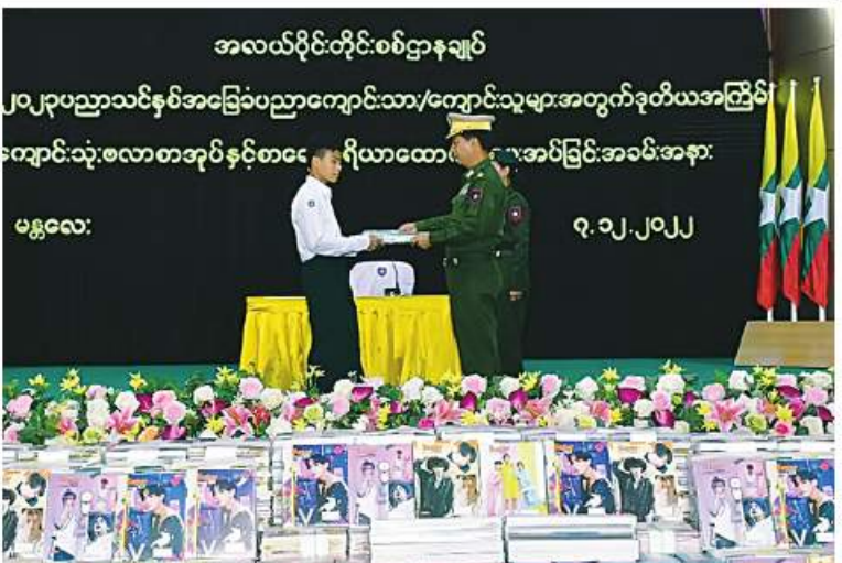
အလယ်ပိုင်းတိုင်းစစ်ဌာနချုပ် တိုင်းမှူး ဝိုလ်ချုပ်ကိုဦးကျောင်းသားတစ်ဦးကို စာရေးကိရိယာများ ထောက်ပံ့ပေးအပ်စဉ်။

အတွင်းရှိ ခရိုင် ၃ ခရိုင်တို့၌ ကျောင်းသား၊ ကျောင်းသူ ၁၃၁ ဦးတို့ကို တပ်မတော်မှ ဆေးအဖွဲ့များက ပြည်သူ့ဆေးရုံများမှ ဆရာဝန်များ၊ သက်ဆိုင်ရာ ကျန်းမာရေး ဝန်ထမ်းများ၊ စေတနာ့ဝန်ထမ်းများနှင့် ပူးပေါင်း၍ ကိုဗစ်-၁၉ ရောဂါကာကွယ်ဆေး ထိုးနှံပေးခြင်းများ ဆောင်ရွက်ပေးသည်။ ထို့ပြင် ကိုဗစ်-၁၉ ရောဂါ ထိန်းချုပ် ကာကွယ်ရာတွင် အထောက်အကူဖြစ်စေ ရန်အတွက် Mask များကို ပြည်သူများ လက်ဝယ်အရောက် တိုင်းစစ်ဌာနချုပ် အသီးသီးမှ တာဝန်ရှိသူများက အခမဲ့ ပေးဝေလျှော့ဒါန်းလျက်ရှိရာ ယနေ့တွင် ရန်ကုန်တိုင်းဒေသကြီးအတွင်းရှိ မြို့နယ် ၄၄ မြို့နယ်နှင့် မန္တလေးတိုင်းဒေသကြီး ဖျော်ဘွယ်မြို့တို့ရှိ စာသင်ကျောင်းများ၊ ဈေးများ၊ လမ်းများ၊ မြို့အဝင်ဝိတ်များနှင့် လူစည်ကားရာနေရာများတွင် နယ်မြေခံ တပ်မတော်သားများက ခရိုင်၊ မြို့နယ် စီမံအုပ်ချုပ်ရေးအဖွဲ့မှ တာဝန်ရှိသူများ၊ ဌာနဆိုင်ရာ ဝန်ထမ်းများ၊ ပရဟိတအဖွဲ့ များနှင့်ပူးပေါင်း၍ ကိုဗစ်-၁၉ ရောဂါ ကာကွယ်ရေးအတွက် အသိပညာပေး ဆောင်ရွက်ခြင်း၊ Mask များ တပ်ဆင်ပြီး သွားလာကြရန် လှုံ့ဆော်ခြင်းနှင့် Mask များကို ဒေသခံပြည်သူများ လက်ဝယ် အရောက် အခမဲ့ပေးဝေလျှော့ဒါန်းခဲ့ကြ ကြောင်း သတင်းရရှိသည်။