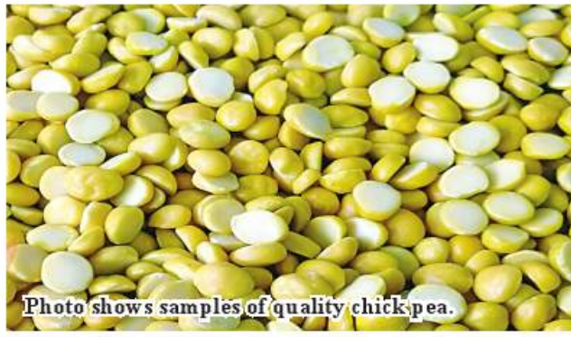
Photo shows samples of quality chick pea.

decrease. Currently, leaves plucked from the chick peas that started growing in October are coming to markets. They are worth K5,000 to K6,000 per viss. According to 3 December market data, a basket of chick peas is priced at around K62,000. 336