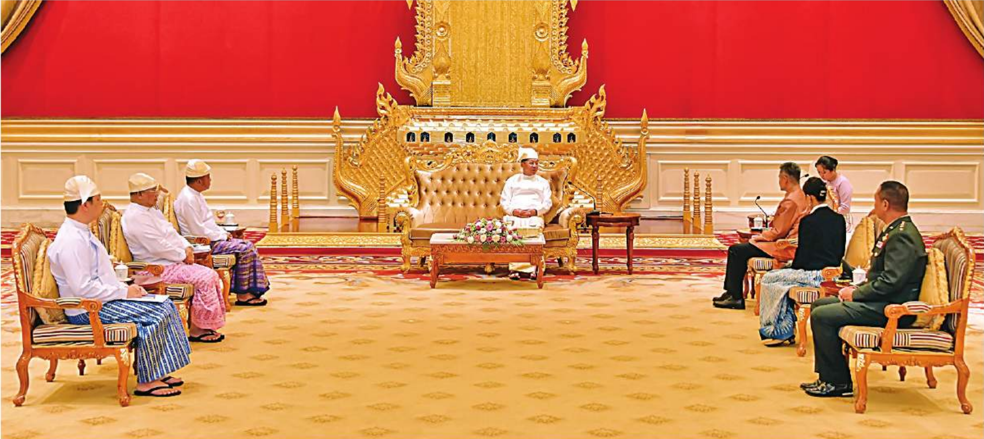
နိုင်ငံတော်စီမံအုပ်ချုပ်ရေးကောင်စီဥက္ကဋ္ဌ နိုင်ငံတော်ဝန်ကြီးချုပ် ပိုလ်ချုပ်မှူးကြီးမင်းအောင်လှိုင်နှင့် မြန်မာနိုင်ငံဆိုင်ရာ ထိုင်းနိုင်ငံသံအမတ်ကြီး H.E. Mr. Mongkol Visitsstump တို့ ရင်းရင်းနှီးနှီး ဆွေးနွေးစဉ်။

နေပြည်တော် ဒီဇင်ဘာ ၇ သံအမတ်ကြီး H.E.Mr.Mongkol Visitsstump ထို့နောက် နှစ်နိုင်ငံ သံတမန်ဆက်ဆံရေး၊ ဆောင်ရွက်သွားမည့်ကိစ္စရပ်များ၊ မြန်မာ-ထိုင်း နိုင်ငံတော်စီမံအုပ်ချုပ်ရေးကောင်စီ ဥက္ကဋ္ဌ သည် ယနေ့နံနက် ၁၀ နာရီတွင် နေပြည်တော် ချစ်ကြည်ရင်းနှီးမှုနှင့် ပူးပေါင်းဆောင်ရွက်ရေးများ အဆင့်မြင့်အရာရှိကြီးများအစည်းအဝေး ကျင်းပ အဖြစ် ခန့်အပ်ရန် သဘောတူညီပြီးဖြစ်သော ခန့်အပ်လွှာကို ပေးအပ်သည်။ ရှိ နိုင်ငံတော်စီမံအုပ်ချုပ်ရေးကောင်စီဥက္ကဋ္ဌရုံး သံတမန်ဆောင်ရွက်ရေးနှင့် ငှင်း၏ သံအမတ် ခန့်အပ်လွှာကို ပေးအပ်သည်။ တိုးမြှင့်ဆောင်ရွက်သွားမည့်ကိစ္စရပ်များ၊ နယ်စပ် နိုင်ငံရေးကိစ္စရပ်များကို ရင်းရင်းနှီးနှီးဆွေးနွေးခဲ့ ကုန်သွယ်မှု၊ စီးပွားရေးရင်းနှီးမြှုပ်နှံမှုနှင့် ခရီးသွား လုပ်ငန်းများပိုမိုဖွံ့ဖြိုးတိုးတက်ရေးအတွက် ပူးပေါင်း ဆောင်ရွက်သွားမည်ကိစ္စရပ်များ၊ အဆင့်မြင့်အရာရှိကြီးများအစည်းအဝေး ကျင်းပ နိုင်ငံရေးကိစ္စရပ်များကို ရင်းရင်းနှီးနှီးဆွေးနွေးခဲ့ ကြသည်။