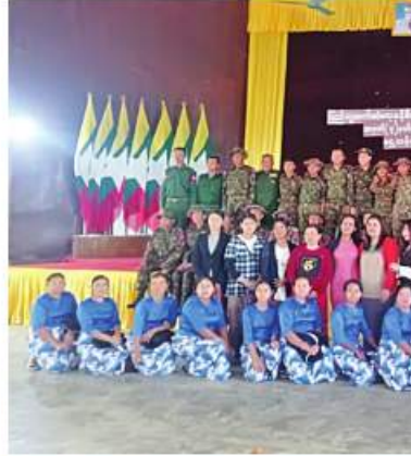
နယ်လှည့်ပြည်သူ့ဆက်ဆံရေးအဖွဲ့များ၊ အရာရှိ၊ စစ်သမား၊ စစ်သမီးများနှင့် မြန်မာ့အသံနှင့်ရုပ်မြင်သံကြား(MRTV)မှ အဖွဲ့သူ၊ အဖွဲ့သားများ နယ်မြေခံတပ်မှ အရာရှိ၊ စစ်သမား၊ မိသားစုဝင်များနှင့်အတူ အမှတ်တရပေါင်းစာတပ်ပုံရိပ်စဉ်။

ကပြလျက်ရှိသည်။ ထိုသို့ သွားရောက်ဂုဏ်ပြုသီဆိုကပြ ဖျော်ဖြေလျက်ရှိရာ ယနေ့တွင် မြောက်ပိုင်း တိုင်းစစ်ဌာနချုပ်နယ်မြေ မြစ်ကြီးနားမြို့နှင့် ပိုင်းမော်မြို့တို့ရှိ နယ်မြေခံတပ်ရင်းဌာနချုပ် များသို့ နယ်လှည့်ပြည်သူ့ဆက်ဆံရေးအဖွဲ့များမှ အရာရှိ၊ စစ်သမားများနှင့် မြန်မာ့အသံနှင့် ရုပ်မြင်သံကြား(MRTV) မှ အဖွဲ့သူ၊ အဖွဲ့သားများက စစ်ချီတေး၊ စစ်သည်တေးသီချင်းများ၊ ခေတ်ပေါ်နှင့် ခေတ်ဟောင်းတေးသီချင်းများဖြင့် သီဆိုကပြဖျော်ဖြေကြရာ တပ်မတော်သားများနှင့် မိသားစုဝင်များက စိတ်လက်ဖျော်ရွှင်ကြည်နူးချမ်းမြေ့စွာဖြင့် ကြည်ရွှာအားပေး၍ အချို့စစ်သည်များနှင့် မိသားစုများက လွတ်လပ်ပေါ့ပါးစွာဖြင့် အတူတကွ ပါဝင်သီဆိုကြသည်။ ထိုကဲ့သို့ လာရောက်သီဆိုဖျော်ဖြေပေးကြသည့် အဖွဲ့သူ၊ အဖွဲ့သားများကို နယ်မြေခံတပ်မှ တာဝန်ရှိသူများနှင့် မိသားစုဝင်များက ဒေသထွက်လက်ဆောင်ပစ္စည်းများပေးအပ်ကြပြီး ဒေသထွက်အစားအစာများဖြင့် ညှော်ပေးကမ်းခဲ့ကြသည်။ ယခုကဲ့သို့ လာရောက်ဖျော်ဖြေနေမှုနှင့်ပတ်သက်၍ လုံခြုံရေးတပ်ဖွဲ့ဝင်များနှင့်