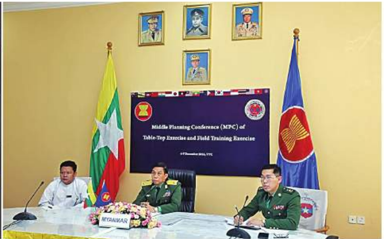
အာဆီယံအပေါင်း အကြမ်းဖက်မှုတန်ပြန်တိုက်ဖျက်ရေးဆိုင်ရာ ကျွမ်းကျင်လုပ်ငန်းအဖွဲ့၏ ဒုတိယအကြိမ်စီမံကိန်းရေးဆွဲရေးအစည်းအဝေး(Middle Planning Conference) ကို Video Teleconferencing (VTC)စနစ်ဖြင့် ကျင်းပစဉ်။

တိုက်ဖျက်ရေးဆိုင်ရာ ကျွမ်းကျင်လုပ်ငန်းအဖွဲ့၏ ရှေ့လုပ်ငန်းစဉ်များကို ပူးပေါင်းဆောင်ရွက်နိုင်ရန် အာဆီယံနိုင်ငံများ၊ ဆွေးနွေးဖက်နိုင်ငံများအကြား ရင်းနှီးပွင့်လင်းစွာ အမြင်ချင်းဖလှယ် အပြန်အလှန် ဆွေးနွေးခဲ့ကြသည်။ အစည်းအဝေးသို့ အာဆီယံအဖွဲ့ဝင်နိုင်ငံများမှ ကိုယ်စားလှယ်များ၊ ဆွေးနွေးဖက်နိုင်ငံများဖြစ်သော ရုရှား၊ တရုတ်၊ အိန္ဒိယတို့မှ ကိုယ်စားလှယ်များနှင့် အာဆီယံအတွင်းရေးမှူးချုပ်ရုံးမှ တာဝန်ရှိသူများ ပါဝင်တက်ရောက်ဆွေးနွေးခဲ့ကြသည်။