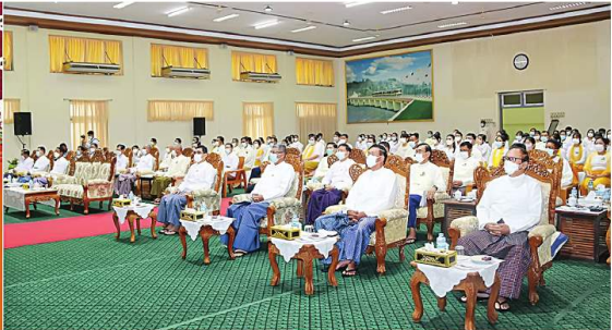
နိုင်ငံတော်စီမံအုပ်ချုပ်ရေးကောင်စီဝင် ဝိုင်းချုပ်ကြီးတင်အောင်စန်း ပြည်ထောင်စုဝန်ကြီး ဝိုင်းချုပ်ကြီးတင်အောင်စန်း ကုန်းလမ်းပို့ဆောင်ရေးညွှန်ကြားမှုဦးစီးဌာန၏ (၅၈)နှစ်မြောက် နှစ်ပတ်လည်နေ့အခမ်းအနားတွင် အမှာစကားပြောကြားခြင်း

နေပြည်တော် ၇ ဇူလိုင် ၂၀၂၂ နိုင်ငံတော်စီမံအုပ်ချုပ်ရေးကောင်စီဝင် ဝိုင်းချုပ်ကြီးတင်အောင်စန်းသည် မြန်မာနိုင်ငံသံအမတ်ကြီး H.E. Mr. Mongkol Visitstump ကို ယနေ့ ဖွန်းလှိုင်ရပ်ကွက်ရှိ နိုင်ငံတော်စီမံအုပ်ချုပ်ရေးကောင်စီဥက္ကဋ္ဌရုံးသို့ ဆွဲနားပြောဆိုခဲ့ပြီး နိုင်ငံတော်စီမံအုပ်ချုပ်ရေးကောင်စီဥက္ကဋ္ဌ နိုင်ငံတော်ဝန်ကြီးချုပ် ခိုင်လုံနှင့် ဆုံဆည်းပူးပေါင်းဆွဲနားပြောခဲ့ခြင်းဖြစ်ကြောင်း သိရသည်။