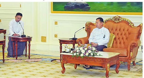
လက်ခံတွေ့ဆုံ နိုင်ငံတော်စီမံအုပ်ချုပ်ရေးကောင်စီ ဒုတိယဝန်ကြီးချုပ် ဒုတိယဝန်ကြီးချုပ်များကြီးစိုးဝင်းနှင့် မြန်မာနိုင်ငံဆိုင်ရာ ထိုင်းနိုင်ငံသံအမတ်ကြီး H.E. Mr. Mongkol Visitstump ကို လက်ခံတွေ့ဆုံခြင်း

ထိုင်းနိုင်ငံသံအမတ်ကြီး H.E. Mr. Mongkol Visitstump တို့သည် အမှတ်တရ လက်ဆောင်ပစ္စည်းများ အပြန်အလှန်အပ်နှံခဲ့ကြောင်း သိရသည်။