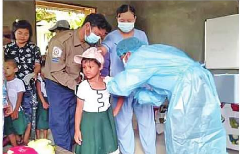
ဧရာဝတီတိုင်းဒေသကြီး ကန်ကြီးထောင့်မြို့ရှိ ဒေသခံပြည်သူများကို ကိုဗစ်-၁၉ ရောဂါကာကွယ်ဆေးထိုးနှံပေးစဉ်။

နေပြည်တော် ဒီဇင်ဘာ ၇ ကိုဗစ်-၁၉ ရောဂါ ကာကွယ် ထိန်းချုပ်၊ ကုသရေးဆောင်ရွက်ရာတွင် ကာကွယ်ဆေး ထိုးနှံခြင်းသည် အဓိကအခန်းကဏ္ဍတွင် ပါဝင်သည် လုပ်ငန်းတစ်ရပ်ဖြစ်သောကြောင့် တိုင်းဒေသကြီးနှင့် ပြည်နယ်အသီးသီးတို့၌ ကာကွယ်ဆေးထိုးနှံခြင်းကို အင်တိုက် အားတိုက်ဆောင်ရွက်လျက်ရှိရာ ယနေ့တွင် ဧရာဝတီတိုင်းဒေသကြီးအတွင်းရှိ မြို့နယ် ၂၆ မြို့နယ်တို့၌ ဒေသခံပြည်သူ ၆၁၀၉ ဦး၊ မန္တလေးတိုင်းဒေသကြီးအတွင်းရှိ ခရိုင် ၃ ခရိုင် ၃ ခရိုင်တို့မှ ဒေသခံပြည်သူဦးရေ ၆၉၈၀ နှင့် ပဲခူးတိုင်းဒေသကြီး တောင်ငူမြို့ရှိ