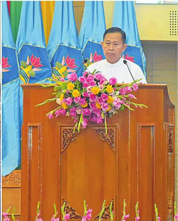
မသန်စွမ်းသူများ၏အခွင့်အရေးများဆိုင်ရာ အမျိုးသားကော်မတီဥက္ကဋ္ဌ နိုင်ငံတော်စီမံအုပ်ချုပ်ရေးကောင်စီဒုတိယဥက္ကဋ္ဌ ဒုတိယဝန်ကြီးချုပ် ဒုတိယဗိုလ်ချုပ်မှူးကြီးစိုးဝင်း၊ ၂၀၂၂ ခုနှစ် အပြည်ပြည်ဆိုင်ရာမသန်စွမ်းသူများနေ့အထိမ်းအမှတ်အခမ်းအနားတွင် အမှာစကားပြောကြားစဉ်။

နေပြည်တော် ၃ နိုဝင်ဘာ ၃ ၂၀၂၂ ခုနှစ် အပြည်ပြည်ဆိုင်ရာ မသန်စွမ်းသူများနေ့ အထိမ်းအမှတ်အခမ်းအနားကို ယနေ့ နံနက် ၁၀ နာရီတွင် နေပြည်တော်ရှိ မြန်မာအပြည်ပြည်ဆိုင်ရာကွန်ဗင်းရှင်းဗဟိုဌာန-၂ ၌ ကျင်းပရာ မသန်စွမ်းသူများ၏ အခွင့်အရေးများဆိုင်ရာ အမျိုးသားကော်မတီဥက္ကဋ္ဌ နိုင်ငံတော်စီမံအုပ်ချုပ်ရေးကောင်စီဒုတိယဥက္ကဋ္ဌ ဒုတိယဝန်ကြီးချုပ် တက်ရောက်အမှာစကားပြောကြားသည်။ အခမ်းအနားသို့ နိုင်ငံတော်စီမံအုပ်ချုပ်ရေးကောင်စီဝင်များ၊ ပြည်ထောင်စုဝန်ကြီးများ၊ နေပြည်တော်တိုင်းစစ်ဌာနချုပ် တိုင်းမှူး၊ ဒုတိယဝန်ကြီးများ၊ အမြဲတမ်းအတွင်းဝန်များ၊ ညွှန်ကြားရေးမှူးချုပ်များ၊ NGO၊ INGO များ၊ မြန်မာနိုင်ငံမသန်စွမ်းသူများအသင်းချုပ်မှ တာဝန်ရှိသူများ၊ မသန်စွမ်းသူများ၊ ဖိတ်ကြားထားသူများနှင့် တာဝန်ရှိသူများ တက်ရောက်ကြသည်။ အခမ်းအနားတွင် မသန်စွမ်းသူများ၏အခွင့်အရေးများဆိုင်ရာ အမျိုးသားကော်မတီဥက္ကဋ္ဌ နိုင်ငံတော်စီမံအုပ်ချုပ်ရေးကောင်စီ ဒုတိယဥက္ကဋ္ဌ ဒုတိယဝန်ကြီးချုပ် ဒုတိယဗိုလ်ချုပ်မှူးကြီးစိုးဝင်းက အမှာစကားပြောကြားရာတွင် မသန်စွမ်းမှုဆိုင်ရာ အရေးကိစ္စများကို သိရှိနားလည်နိုင်စွမ်းမြှင့်တင်ရန်၊ မသန်စွမ်းသူများ၏ ဂုဏ်သိက္ခာ၊လူ့အခွင့်အရေးများနှင့် ကောင်းကျိုးစီးပွားတို့အတွက် ပံ့ပိုးကူညီဆောင်ရွက်နိုင်ရေးစည်းရုံးလှုံ့ဆော်ရန်အတွက်