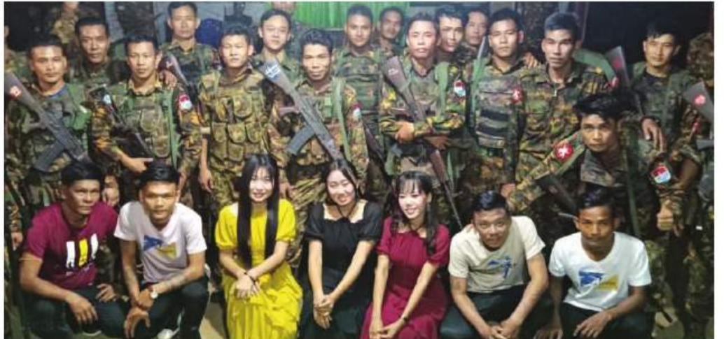
နယ်လှည့်ပြည်သူ့ဆက်ဆံရေးအဖွဲ့မှ စစ်သည်၊ စစ်သမီးများ ရှေ့တန်းတစ်နေရာတွင် တပ်မတော်သားများနှင့် အမှတ်တရပေါင်းစာတံပုံ။

နေပြည်တော် ၃ ဇူလိုင် ၂၀၂၂ မြန်မာနိုင်ငံ၏ နယ်စပ်နယ်မြေအသီးသီးတွင် မိဝေးဖဝေးနှင့် မိသားစုဝေးကွာစွာဖြင့် နိုင်ငံတော်ကာကွယ်ရေးနှင့် လုံခြုံရေးတာဝန်များကို နေ့မအား၊ ညမနား ထမ်းဆောင်လျက်ရှိသည့် ရှေ့တန်းရောက် တပ်မတော်သားများနှင့် နယ်ခြားစောင့်တပ်ဖွဲ့များ တာဝန်ထမ်းဆောင်မှု စိတ်ပျော်ရွှင်ကြည်နူးချမ်းမြေ့စေရန်နှင့် ဘဝအမောများ ပြေပျောက်စေရန်အတွက် မြန်မာ့အသံနှင့်