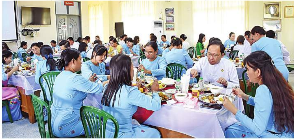
နေပြည်တော် ဒီဇင်ဘာ ၃

ပြည်သူ့လူထုကို အရည်အသွေးပြည့်ဝသော ကျန်းမာရေးစောင့်ရှောက်မှုပေးနိုင်ရန်အတွက် လိုအပ်သောအရည်အချင်းပြည့်မီသည့် ကျန်းမာရေးလူ့စွမ်းအားစုအမျိုးမျိုးကို အမျိုးသားကျန်းမာရေးစီမံကိန်းလိုအပ်ချက်နှင့်အညီ လေ့ကျင့်မွေးထုတ်ပေးနေသော ကျန်းမာရေးဝန်ကြီးဌာန ကျန်းမာရေးလူ့စွမ်းအားအရင်းအမြစ်ဦးစီးဌာန နိုင်ငံ့ဝန်ထမ်းများ၏ မိသားစုမိတ်ဆုံနေ့လယ်စာစားပွဲကို ယနေ့မနန်းတည့် ၁၂ နာရီတွင် ကျန်းမာရေးလူ့စွမ်းအားအရင်းအမြစ်ဦးစီးဌာန(ရုံးချုပ်)၌ ကျင်းပသည်။ စုပေါင်းမိတ်ဆုံ နေ့လယ်စာစားပွဲတွင် ပြည်ထောင်စုဝန်ကြီး ဒေါက်တာသက်ခိုင်ဝင်း