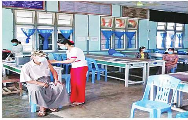
ဧရာဝတီတိုင်းဒေသကြီး ကျောင်းကုန်းမြို့ရှိ ဒေသခံပြည်သူများကို ကိုဗစ်-၁၉ ရောဂါကာကွယ်ဆေးထိုးနှံပေးစဉ်။

အသီးသီးမှ တာဝန်ရှိသူများက အခမဲ့ပေးဝေလျှော့ဒါန့်လျက်ရှိရာ ယနေ့တွင် ရန်ကုန်တိုင်းဒေသကြီးအတွင်းရှိ မြို့နယ် ၄၄ မြို့နယ်တို့မှ စာသင်ကျောင်းများ၊ ဈေးများ၊ လမ်းများ၊ မြို့အဝင်ဝိတ်များနှင့် လူစည်ကားရာနေရာများတွင် နယ်မြေခံတပ်မတော်သားများက ခရိုင်၊ မြို့နယ်စီမံအုပ်ချုပ်ရေးအဖွဲ့မှ တာဝန်ရှိသူများ၊ ဌာနဆိုင်ရာဝန်ထမ်းများ၊ ပရဟိတအဖွဲ့များနှင့်ပူးပေါင်း၍ ကိုဗစ်-၁၉ ရောဂါ ကာကွယ်ရေးအတွက် အသိပညာပေးဆောင်ရွက်ခြင်း၊ Mask များတပ်ဆင်ပြီး သွားလာကြရန်လှုံ့ဆော်ခြင်းနှင့် Mask များကို ဒေသခံပြည်သူများ လက်ဝယ်အရောက် အခမဲ့ပေးဝေလျှော့ဒါန့်ခဲ့ကြောင်း သတင်းရရှိသည်။