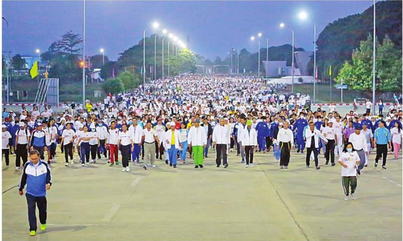
၂၀၂၂ ခုနှစ် ဒီဇင်ဘာလူထုအားကစားလှုပ်ရှားမှုအထိမ်းအမှတ် စုပေါင်းလမ်းလျှောက်ပွဲကျင်းပစဉ်။

နေပြည်တော် ဒီဇင်ဘာ ၃ အားကစားနှင့် လူငယ်ရေးရာဝန်ကြီးဌာနအနေဖြင့် လူတစ်ဦးချင်းမှအစပြု၍ တစ်မျိုးသားလုံးကျန်းမာကြံ့ခိုင်စေရေးနှင့် မြန်မာ့အားကစားလောကအဆင့်အတန်းတိုးတက်မြှင့်တင်ရေး ရည်ရွယ်