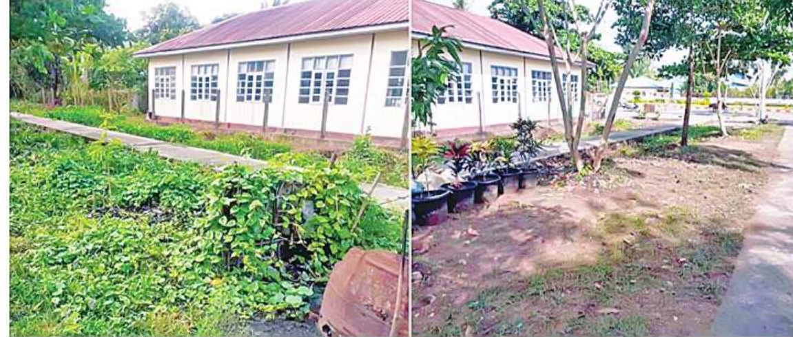
ရန်ကုန်တိုင်းဒေသကြီး ကွမ်းခြံကုန်းမြို့နယ်၌ သန့်ရှင်းရေးမပြုလုပ်ခံ(ဝဲပုံ)နှင့် သန့်ရှင်းရေးမပြုလုပ်ပြီး(ယာပုံ)ကို တွေ့ရစဉ်။

တစ်လျှောက်တို့တွင် အမှိုက်ကောက်ခြင်းနှင့် ရုပ်ကွက်နေပြည်သူများ တစ်ဖက်တစ်လမ်းမှ သက်သာချောင်ချိမှုရှိစေရန် ပြည်သူများထံမှအမှိုက်တစ်ပိဿာလျှင် ၁၀၀ ကျပ်ဖြင့် ဝယ်ယူပေးနိုင်ခဲ့ကြောင်း သိရှိရသည်။ ယင်းသို့ ဆောင်ရွက်ပေးနေမှုများကို သက်ဆိုင်ရာတိုင်းစစ်ဌာနချုပ်များမှ တာဝန်ရှိသူများနှင့် ဌာနဆိုင်ရာတာဝန်ရှိသူများက လိုက်လံကြည့်ရှုအားပေးပြီး လိုအပ်သည်များ ညှိနှိုင်းဆောင်ရွက်ပေးခဲ့ကြောင်း သတင်းရရှိသည်။