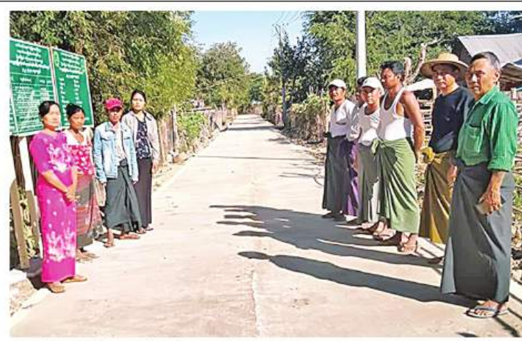
စတင်အကောင်အထည်ဖော် ဆောင်ရွက် ပြီးစီးပြီဖြစ်ကြောင်း သိရသည်။ ခဲရာ ယခုအခါ ရာနှုန်းပြည့်ဆောင်ရွက် ကျော်ခဲ့

ကျေးရွာတွင်းလမ်းအရှည်ပေ ၇၂၀၊ အကျယ် ၁၂ ပေ၊ အမြင့် ခြောက်လက်မရှိ ကွန်ကရစ်ခင်းခြင်းလုပ်ငန်းကို ကျေးလက်ဒေသဖွံ့ဖြိုးတိုးတက်ရေးဦးစီးဌာန ကျေးရွာဖွံ့ဖြိုးတိုးတက်ရေးလုပ်ငန်းစီမံကိန်း ပံ့ပိုးရန်ပုံငွေကျပ်သိန်း ၁၀၀၊ ကျေးရွာနေပြည်သူထည့်ဝင်ငွေကျပ် ၆၅ ဒသမ ၉ သိန်း စုစုပေါင်း ငွေကျပ်သိန်း ၁၆၅ ဒသမ ၉ သိန်းဖြင့် ကျေးလက်ဒေသဖွံ့ဖြိုးတိုးတက်ရေးဦးစီးဌာန ဝန်ထမ်းများက အနီးကပ်ကြီးကြပ်ကာ ကျေးရွာသူ၊ ကျေးရွာသားများကိုယ်တိုင် အောက်တိုဘာလပထမပတ်က