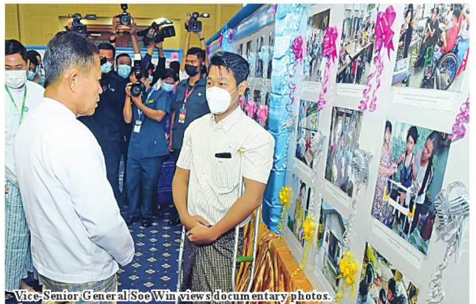
Vice-Senior General Soe Win views documentary photos.