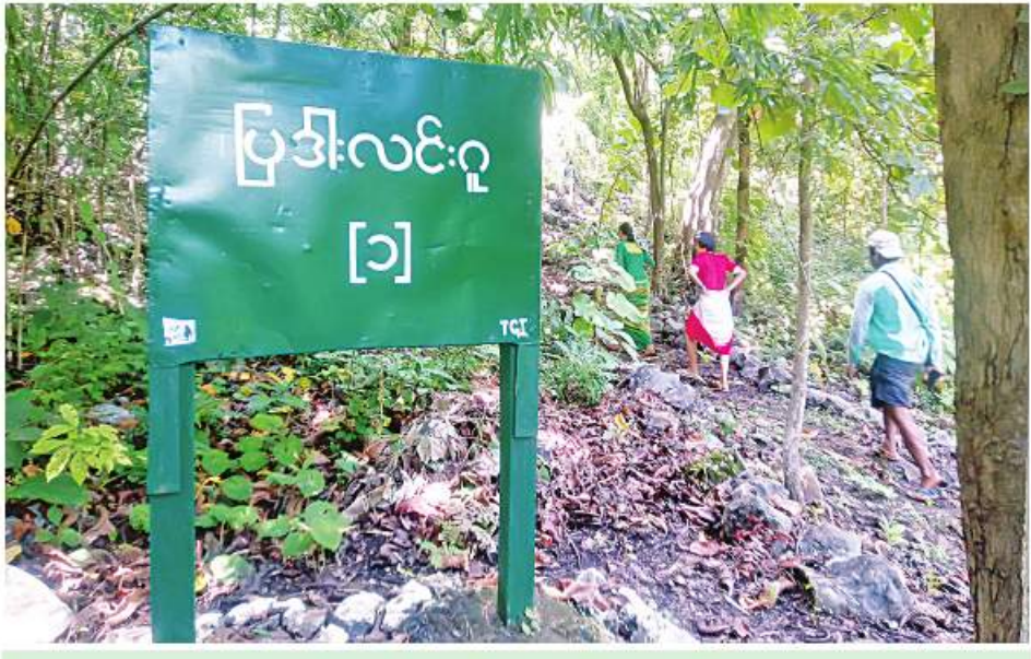
ပြဒါးလင်းဂူအဝင်နေရာကို တွေ့ရစဉ်။

ခဏနားရင်း၊ စားသောက်နေကြရင်း ဘုန်းကြီးကျောင်းမှာနေတဲ့ ကပွိုယကြီးတစ်ယောက်က အခုလိုကပွိုယတွေ စက်လှေသမားကို လမ်းပြအဖြစ်သွားသွားသင့်ကြောင်း၊ တောတွင်းခရီးမှာ လမ်းမှားနိုင်ကြောင်း၊ လမ်းပြငှားရမ်းခ ၄၅၀၀၀ သာရှိကြောင်း၊ စေတနာနဲ့ရှင်းလင်းပြောဆိုပြတာကြောင့် စက်လှေသမားကို လမ်းပြအဖြစ်ငှားရမ်းသွားကြရတယ်။ စက်လှေသမားတွေက ဒီခရီးလမ်းကို အထပ်ထပ်အခါခါ သွားလာနေကျဖြစ်တာကြောင့် သူတို့က ကျွမ်းကျင်နေကြပါပြီ။ ပြဒါးလင်းဂူခရီးအတွက် စက်လှေခ ၄၅၀၀၀ နဲ့ လမ်းပြငှားခ ၄၅၀၀၀