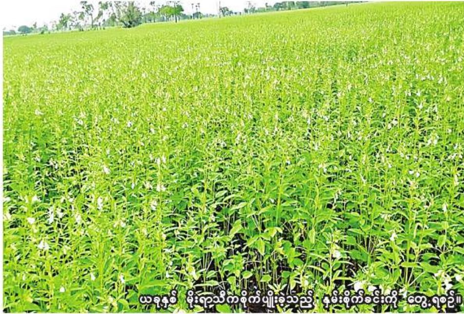
ယခုနှစ် မိုးရာသီကစိုက်ပျိုးခဲ့သည့် နှမ်းစိုက်ခင်းကို တွေ့ရစဉ်။

ရွှေဘို ဒီဇင်ဘာ ၃ စစ်ကိုင်းတိုင်းဒေသကြီး ရွှေဘိုခရိုင်တွင် ယခုနှစ် ဆောင်းသီးနှံ စိုက်ပျိုးရာသီ၌ ဆီထွက်သီးနှံ ၁၆၅၀၁၉ ဧက စိုက်ပျိုးပြီးစီးပြီဖြစ်ကြောင်း ရွှေဘိုခရိုင်စိုက်ပျိုးရေးဦးစီးဌာနမှ သိရသည်။ ယခုနှစ် ဆောင်းသီးနှံစိုက်ပျိုးရာသီ၌ ရွှေဘိုခရိုင်တွင် ဆီထွက်