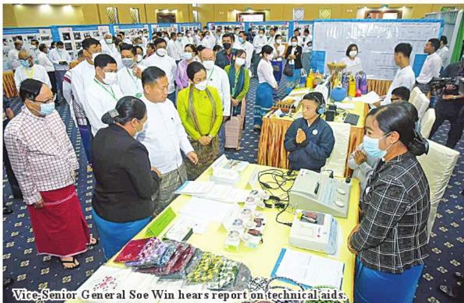
Vice-Senior General Soe Win hears report on technical aids.

In accordance with the rights of persons with disabilities law, it is necessary to make sure the disabled people are not sidelined in political, economic, social,