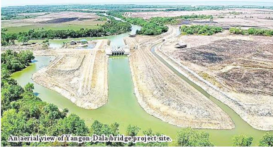
An aerial view of Yagon-Dala bridge project site.

Yagon December 3 The Yagon-Dala river-crossing bridge project in Yagon Region has completed by 48%, according to sources from the Bridge Department under the Ministry of Construction.