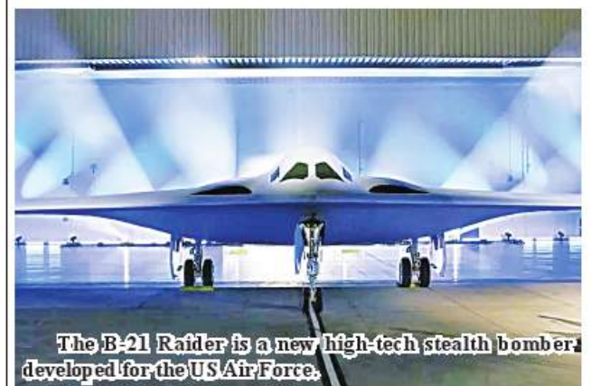
The B-21 Raider is a new high-tech stealth bomber developed for the US Air Force.