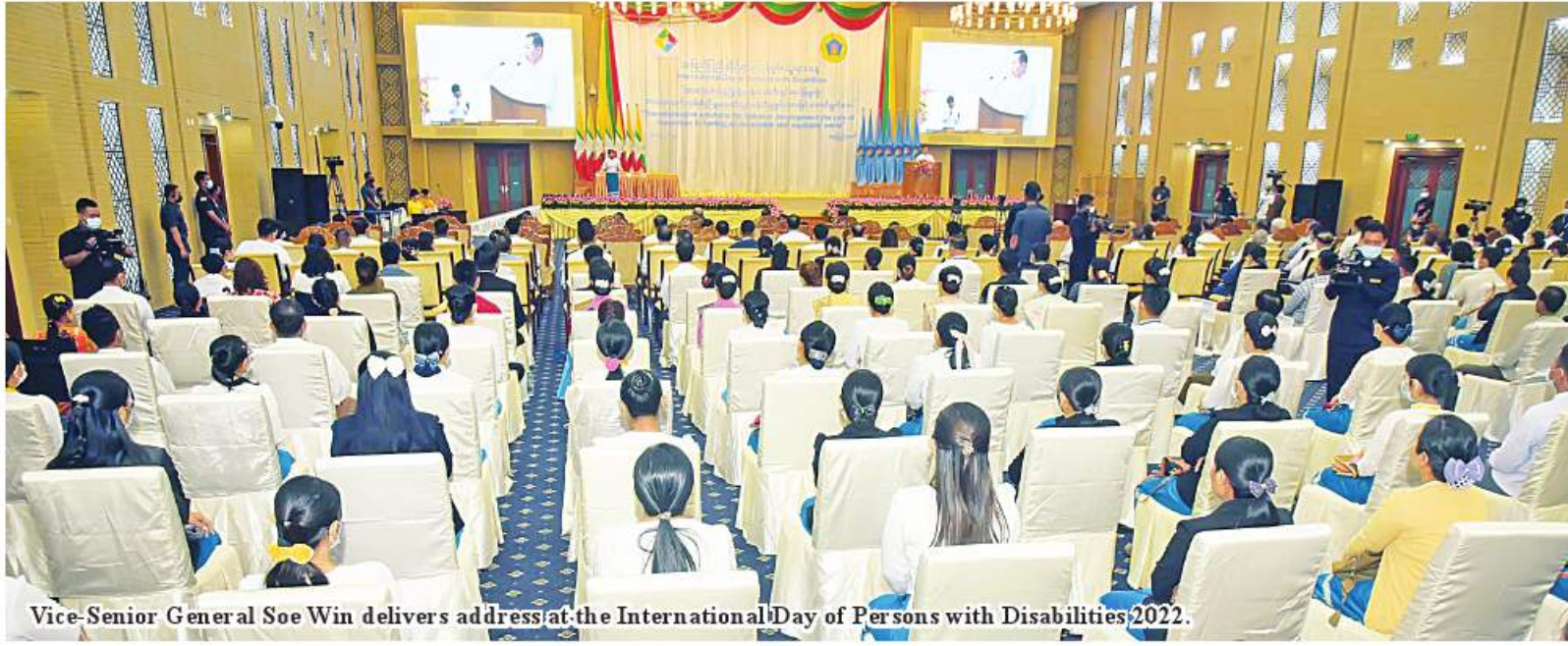
Vice-Senior General Soe Win delivers address at the International Day of Persons with Disabilities 2022.