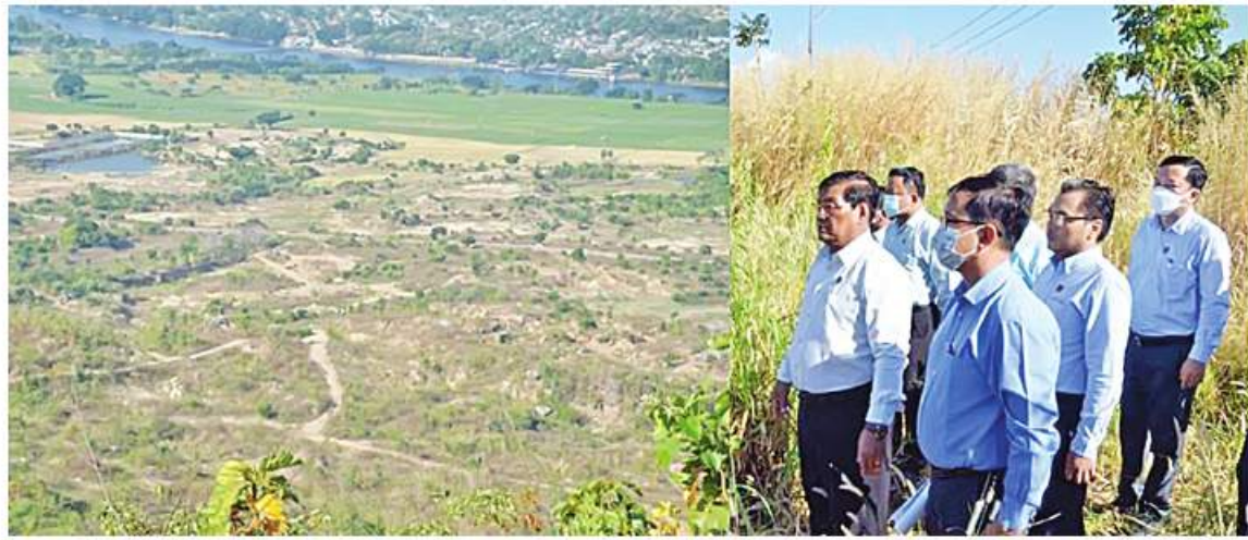
နေပြည်တော် ဒီဇင်ဘာ ၃

လျှပ်စစ်စွမ်းအားဝန်ကြီးဌာန ပြည်ထောင်စုဝန်ကြီး ဦးသောင်းဟန်သည် ဒုတိယဝန်ကြီးနှင့်အတူ ယနေ့နံနက်ပိုင်းတွင် နေပြည်တော်ကောင်စီနယ်မြေ ပျဉ်းမနားမြို့နယ်နှင့် လယ်ဝေးမြို့နယ်အတွင်းရှိ လျှပ်စစ်ဓာတ်အားတိုးတက်ထုတ်လုပ်ရန်နှင့် အသေးစားရေအားလျှပ်စစ်နှင့် အခြားလျှပ်စစ်ဓာတ်အားပေးစက်ရုံများ တည်ဆောက်နိုင်မည့်နေရာများသို့ သွားရောက်ကြည့်ရှုစစ်ဆေးသွားသည်။ ရှေးဦးစွာ ပြည်ထောင်စုဝန်ကြီးနှင့်အဖွဲ့သည် ပေါင်းလောင်းရေလွှဲဆည်နှင့် အောက်ဘက်နေရာနှစ်ခုတွင် အသေးစားရေအားလျှပ်စစ်ဖြစ်မြောက်နိုင်မည့် အခြေအနေကို ကြည့်ရှုစစ်ဆေးပြီး ပေါင်းလောင်းချောင်း၏အရှေ့ဘက်ခြမ်းတွင် နေရောင်ခြည်စွမ်းအင်သုံး ဓာတ်အားပေးစက်ရုံနှင့် အခြားလျှပ်စစ်ဓာတ်အားပေးစက်ရုံများ