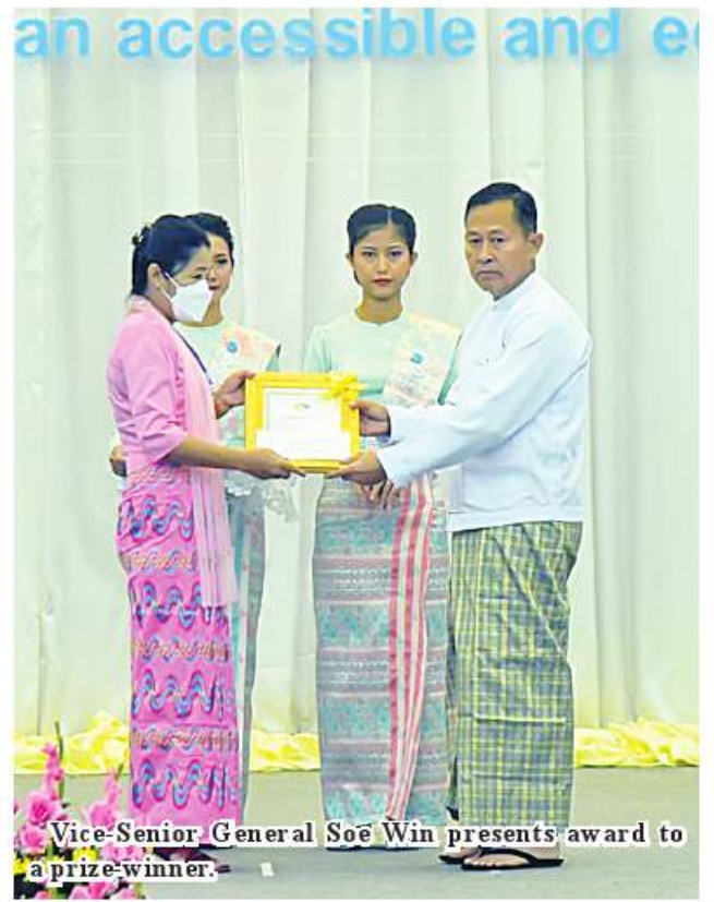
Vice-Senior General Soe Win presents award to a prize-winner.

those with disabilities. The increasing fund should be