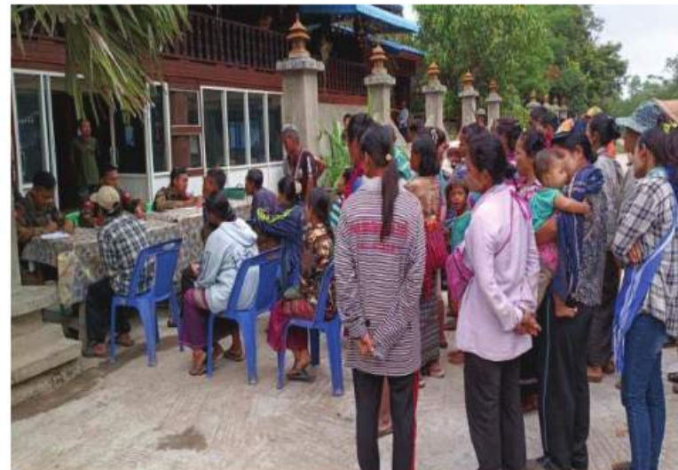
သေဘောဘိုးကျေးရွာနှင့် ဘလက်ခိုကျေးရွာတို့သို့ ပြန်လည်ဝင်ရောက်လာသည့် ဒေသခံပြည်သူများကို တာဝန်ရှိသူများက လက်ခံစဉ်။

နေပြည်တော် ၃ ဇူလိုင် ၂၀၂၂ ကရင်ပြည်နယ်အတွင်းရှိ ဖလူး၊ ကျောက်ခက်၊ သေဘောဘိုး၊ ဝေါလေဒေသ တစ်ဝိုက်နှင့် မြဝတီ-ဝေါလေကားလမ်း တစ်လျှောက်တို့ကို KNU၊ KNLA မှ အကြမ်းဖက်မှုကို လိုလားသော အဖွဲ့၊ NUG အဖွဲ့နှင့် ၎င်း၏လက်ဝေခံ PDF အမည်ခံအကြမ်းဖက်သမားများက ၂၀၂၂ ခုနှစ် မေလမှစတင်ထိန်းချုပ်၍ အဆိုပါဒေသ တစ်ဝိုက်ရှိ လူနေအိမ်များ၊ ဘာသာရေး ဆိုင်ရာအဆောက်အအုံများ၊ စာသင် ကျောင်းများအတွင်း ဝင်ရောက်နေထိုင်ကာ အဖျက်အမှောင်လုပ်ငန်းများ လုပ်ဆောင် ခြင်း၊ ခြိမ်းခြောက်ခြင်းများကြောင့် ဒေသခံ တိုင်းရင်းသားများအနေဖြင့် ဘေးလွတ်ရာ နေရာများသို့ ခေတ္တထွက်ပြေးတိမ်းရှောင် လျက်ရှိသည်။