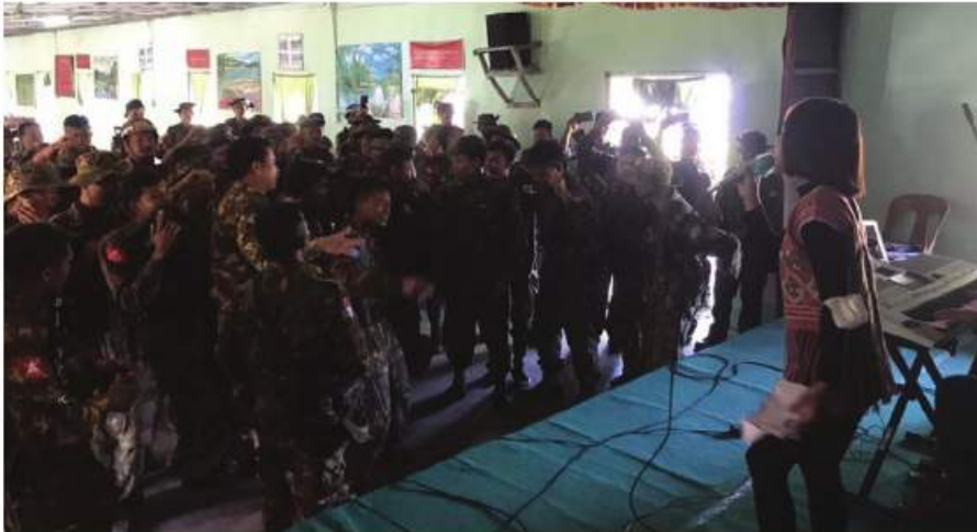
MRTV မှ ဖျော်ဖြေရေးအဖွဲ့သူ၊ အဖွဲ့သားများက ကြာအင်းဆိပ်ကြီးတပ်နယ်ရှိ လုံခြုံရေး တပ်ဖွဲ့ဝင်များအား ဖျော်ဖြေနေမှုမှတစ်ဆင့်