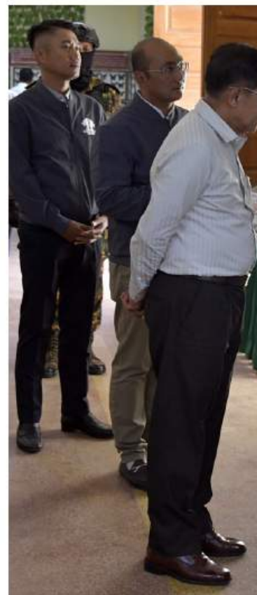
နိုင်ငံတော်စီမံအုပ်ချုပ်ရေးကောင်စီဥက္ကဋ္ဌ နိုင်ငံတော်ဝန်ကြီးချုပ် ဗိုလ်ချုပ်မှူးကြီးမင်းအောင်လှိုင် အမျိုးသားကန်တော်ကြီး ဥယျာဉ်အတွင်း လှည့်လည်ကြည့်ရှုစဉ်။

ကြောင်း၊ ရေတံခွန်အတွင်း ရေသန့်စင် စေရေး သဘာဝရေသန့်စင်စနစ်ကို အသုံးပြုထားသဖြင့် ရေကစားလိုသူများ အနေဖြင့်လည်း သန့်ရှင်းပြီး ကျန်းမာရေး နှင့် ညီညွတ်စွာရေကစားမှုပြုနိုင်မည်ဖြစ်