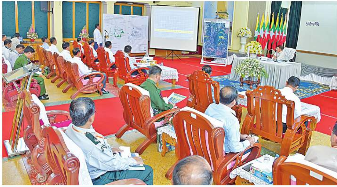
နိုင်ငံတော်စီမံအုပ်ချုပ်ရေးကောင်စီဥက္ကဋ္ဌ နိုင်ငံတော်ဝန်ကြီးချုပ် ဝိုလ်ချုပ်မှူးကြီးမင်းအောင်လှိုင်အား ခိုက်ပျိုးရေးဌာန ညွှန်ကြားရေးမှူးချုပ် ဒေါက်တာရဲတင်ထွန်းက ကော်မီတီခိုက်ပျိုးထားရှိမှုနှင့်ပတ်သက်၍ ရင်းလင်းတင်ပြစဉ်။

ကျော့မှအဆက် ကော်မီတီခိုက်ပျိုးရန်ခွင့်ပြုထားသည့် စိုက်ပျိုး မြေများပေါ်တွင် ကော်မီတီများ စနစ်တကျ စိုက်ပျိုးရေး စည်းကမ်း၊ ဥပဒေ၊ လုပ်ထုံး လုပ်နည်းများနှင့်အညီ ကြပ်မတ်ဆောင်ရွက် လျက်ရှိမှု အခြေအနေများကို ရင်းလင်း တင်ပြသည်။