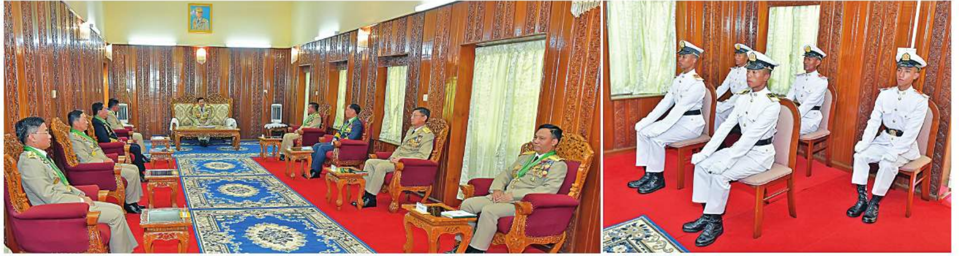
နိုင်ငံတော်စီမံအုပ်ချုပ်ရေးကောင်စီဥက္ကဋ္ဌ တပ်မတော်ကာကွယ်ရေးဦးစီးချုပ် ဗိုလ်ချုပ်မှူးကြီး မဟာသရေစည်သူမင်းအောင်လှိုင် စစ်တက္ကသိုလ် ဗိုလ်လောင်းသင်တန်းအမှတ်စဉ်(၆၄)မှ ထူးချွန်ဆုရရှိကြသည့် ဗိုလ်လောင်း ငါးဦးအားတွေ့ဆုံ၍ ဂုဏ်ပြုအမှာစကားပြောကြားစဉ်။

စာမျက်နှာ ၁၇ မှအဆက် မျှဝေခံစားခြင်းဖြစ်ကြောင်း။ ထို့ကြောင့် ဒီမိုကရေစီနှင့် ဖက်ဒရယ် စနစ်ကိုအခြေခံသည့် ပြည်ထောင်စုစနစ်ဟု ဆိုရာတွင် ပြည်ထောင်စုအတွင်းရှိ တိုင်းရင်းသားပြည်သူများက ရွေးချယ်သည့် အုပ်ချုပ်ရေးစနစ်တွင် ပြည်ထောင်စု တစ်ဝန်းလုံးရှိ တိုင်းရင်းသားအဖွဲ့အစည်းများ အတူတကွပေါင်းစည်းနေထိုင်ပြီး တိုင်းဒေသကြီး၊ ပြည်နယ်များအလိုက် အခြေခံဥပဒေ အရ ပြဋ္ဌာန်းခွင့်များရရှိမည်ဖြစ်ကြောင်း။