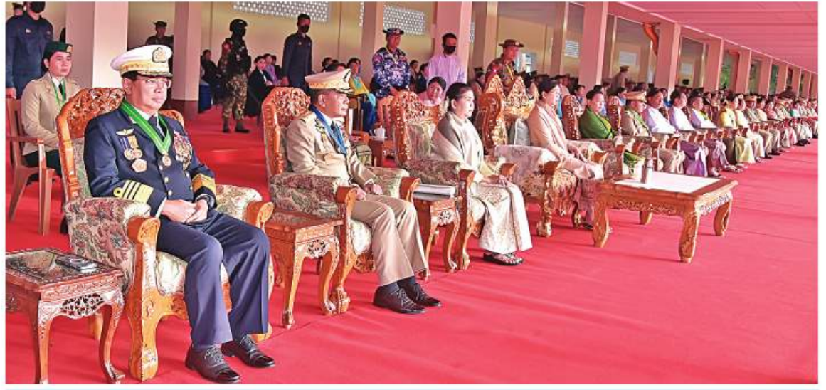
စစ်တက္ကသိုလ် ဗိုလ်လောင်းသင်တန်းအမှတ်စဉ်(၆၄) သင်တန်းဆင်းဂုဏ်ပြုခမ်းရေးပြအခမ်းအနားသို့ တက်ရောက်လာသည့် နိုင်ငံတော်စီမံအုပ်ချုပ်ရေးကောင်စီဥက္ကဋ္ဌ တပ်မတော်ကာကွယ်ရေးဦးစီးချုပ် ဗိုလ်ချုပ်မှူးကြီး မဟာသရေစည်သူမင်းအောင်လှိုင်၏ ဓနိုး ဒေါ်ကြူကြူလှ၊ တပ်မတော်အရာရှိကြီးများနှင့် ဓနိုးများ ပြည်ထောင်စုဝန်ကြီးများနှင့် ဧည့်သည်တော်များကို တွေ့ရစဉ်။

ပြန်တမ်းဝင်အရာရှိခန့်အပ်ပွဲပြီးပါက Under-Training ကာလပြီးဆုံးပြီဖြစ်ပြီး မိမိကိုယ်ကိုထိန်းသိမ်းနေထိုင်မှု Self-Control ပြင်သာဘဝကိုလျှောက်လှမ်းရမည်ဖြစ်ကြောင်း၊ မိမိကိုယ်တိုင်စောင့်ထိန်းနိုင်မှုသည် အရေးကြီးပြီး စောင့်ထိန်းနိုင်မှုမရှိခြင်းကြောင့် ဆုံးရှုံးမှုကြီးမားခဲ့မှုများများစွာရှိကြောင်း။ ထူးချွန်ဆုရ ဗိုလ်လောင်းများ၏မိဘများသည် တောင်သူလယ်သမားများ၊ သာမန်အခြေခံမိသားစုများပင်ဖြစ်သည်ကို တွေ့ရှိရပြီး ယခုကဲ့သို့ ထူးချွန်ထက်မြက်သူများဖြစ်လာစေရေး ငယ်စဉ်ကတည်းကပင် ကျွေးမွေးပြုစုပျိုးထောင်ပေးခဲ့သည့် မိဘများ၏ကျေးဇူးကို သိတတ်ရန်နှင့် ကျေးဇူးဆပ်ရန်လိုအပ်မည်ဖြစ်ကြောင်း၊ ထို့အတူ ဗိုလ်လောင်းသင်တန်း လေးနှစ်တာကာလအတွင်း တပ်မတော်၏ ဓါတ်ဆောင်ငယ်များဖြစ်လာစေရေး လေ့ကျင့်မွေးထုတ်ပေးခဲ့သည့် တပ်မတော်နှင့် အမိစစ်တက္ကသိုလ်၏ကျေးဇူးကိုလည်း မမေ့ရန်လိုကြောင်း။