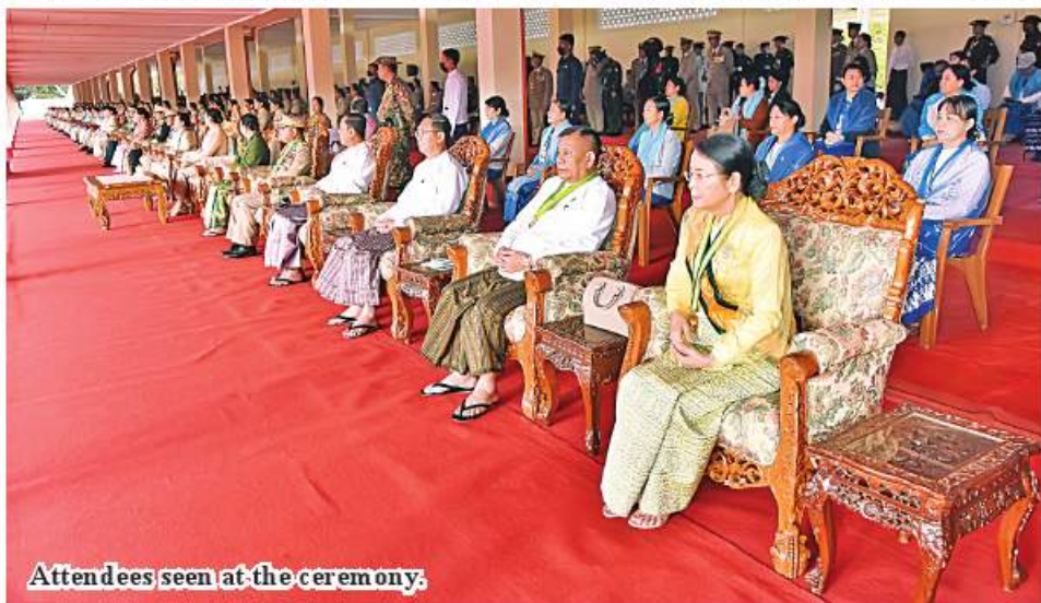
Attendees seen at the ceremony.