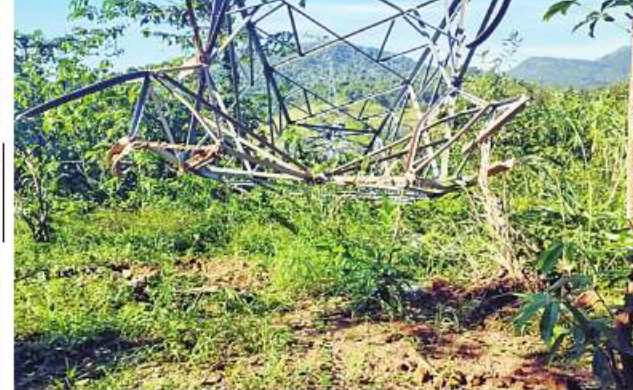
သက်နိုးညီနောင်မှ ကော့ကရိတ်မြို့နယ်နှင့် ကြာအင်းဆိပ်ကြီးမြို့နယ် တို့သို့ သွယ်တန်းထားသည့် ၆၆ ကေစီ မဟာဓာတ်အားလိုင်းမှ တာဝါတိုင်အမှတ်(၄၆) ပျက်စီးမှုမှတ်တမ်းဓာတ်ပုံ။