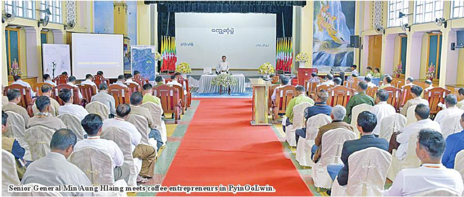
Senior General Min Aung Hlaing meets coffee entrepreneurs in PyinOoLwin.

Nay Pyi Taw December 2 Chairman of the State Administration Council Prime Minister Senior General Min Aung Hlaing met coffee entrepreneurs from PyinOoLwin in Mandalay Region at the town hall of PyinOoLwin this morning and discussed coffee cultivation.