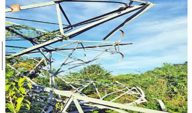
သက်နိုးညီနောင်မှ ကော့ကရိတ်မြို့နယ်နှင့် ကြာအင်းဆိပ်ကြီးမြို့နယ် တို့သို့ သွယ်တန်းထားသည့် ၆၆ ကေစီ မဟာဓာတ်အားလိုင်းမှ တာဝါတိုင်အမှတ်(၄၇) ပျက်စီးမှုမှတ်တမ်းဓာတ်ပုံ။