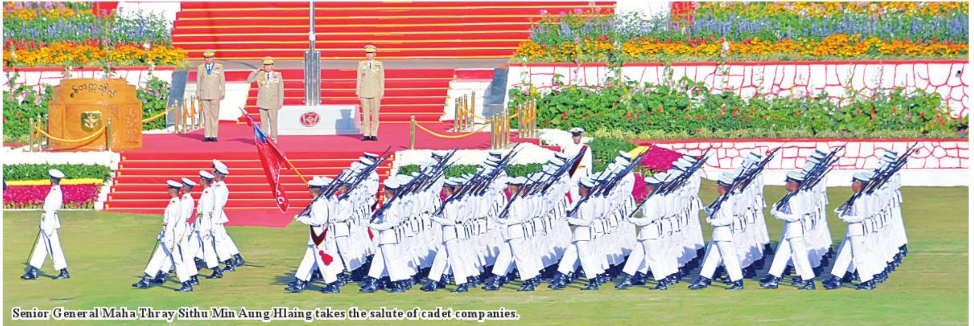
Senior General Maha Thray Sithu Min Aung Hlaing takes the salute of cadet companies.