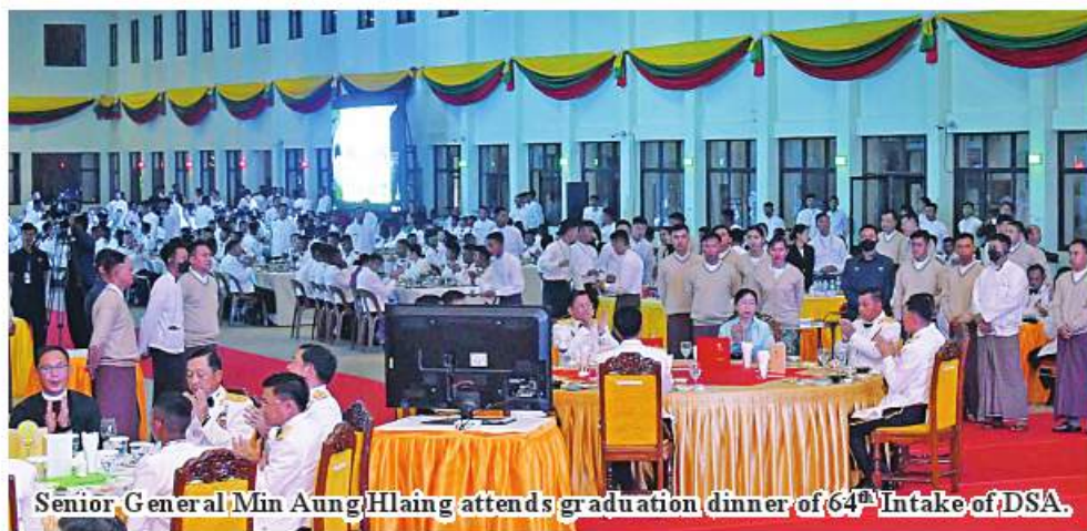
Senior General Min Aung Hlaing attends graduation dinner of 64 th Intake of DSA.