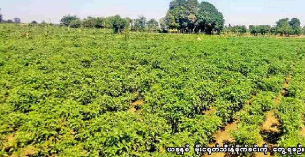
ယခုနှစ် မိုးငရုတ်သီး၊ နှစ်စိုက်ခင်းကို တွေ့ရစဉ်။