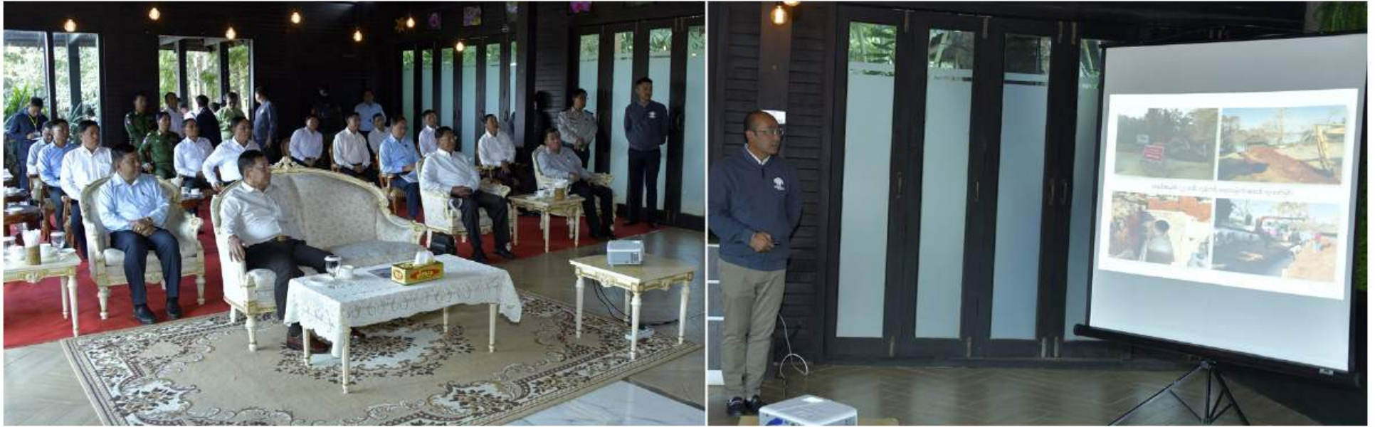
နိုင်ငံတော်စီမံအုပ်ချုပ်ရေးကောင်စီဥက္ကဋ္ဌ နိုင်ငံတော်ဝန်ကြီးချုပ် ဗိုလ်ချုပ်မှူးကြီးမင်းအောင်လှိုင်အား ပြင်ဦးလွင်မြို့ အမျိုးသားကန်တော်ကြီးဥယျာဉ်မှ တာဝန်ရှိသူတစ်ဦးက အမျိုးသားကန်တော်ကြီး ဥယျာဉ်ဆိုင်ရာ အချက်အလက်များနှင့်ပတ်သက်၍ ရှင်းလင်းတင်ပြစဉ်။

နေပြည်တော် ၃ ဇူလိုင် ၂၀၂၂ နိုင်ငံတော်စီမံအုပ်ချုပ်ရေးကောင်စီ ဥက္ကဋ္ဌ နိုင်ငံတော်ဝန်ကြီးချုပ် ဗိုလ်ချုပ်မှူးကြီး မင်းအောင်လှိုင်သည် ယနေ့နေ့လယ်ပိုင်းတွင် ကောင်စီတွဲဖက်အတွင်းရေးမှူး ဒုတိယ ဗိုလ်ချုပ်ကြီးရဲဝင်းဦး၊ ပြည်ထောင်စုဝန်ကြီးများဖြစ်ကြသည့် ဦးလှမိုး၊ ဦးခင်မောင်ရီ၊ ကာကွယ်ရေးဦးစီးချုပ်ရုံးမှ တပ်မတော် အရာရှိကြီးများ၊ အလယ်ပိုင်းတိုင်း စစ်ဌာနချုပ် တိုင်းမှူး ဗိုလ်ချုပ်ကိုကိုဦးနှင့် အဖွဲ့ဝင်များလိုက်ပါ၍ ပြင်ဦးလွင်မြို့ရှိ အမျိုးသားကန်တော်ကြီးဥယျာဉ်ထိန်းသိမ်းဆောင်ရွက်ထားရှိမှု အခြေအနေများကို သွားရောက်ကြည့်ရှုစစ်ဆေးသည်။