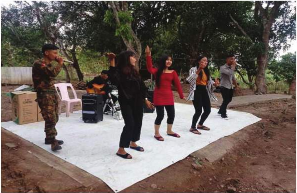
နယ်လှည့်ပြည်သူ့ဆက်ဆံရေးအဖွဲ့များမှ စစ်သည်၊ စစ်သမီးများ ရှေ့တန်းတစ်နေရာ၌ ဖျော်ဖြေနေစဉ်။

အလှည့်ကျစနစ်ဖြင့် စိတ်ပျော်ရွှင်ကြည်နူး ချမ်းမြေ့စွာဖြင့် ကြည့်ရှုအားပေးခဲ့ကြ ကြောင်းနှင့် ဖျော်ဖြေမှုအပေါ် ဝမ်းသာပီတိ ဖြစ်စွာနှင့် ရှေ့တန်းအရောက် လာရောက် ဖျော်ဖြေပေးကြသူများကို မိမိတို့ ချွေးနံ့တဖြင့် ရရှိသည့်လစာအချို့မှ စုပေါင်း၍ ဂုဏ်ပြုဆုငွေများလည်း ပေးအပ်ချီးမြှင့်ခဲ့ကြကြောင်း သတင်း ရရှိသည်။