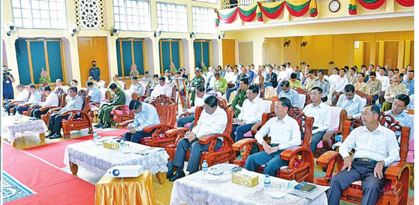
နိုင်ငံတော်စီမံအုပ်ချုပ်ရေးကောင်စီဥက္ကဋ္ဌ နိုင်ငံတော်ဝန်ကြီးချုပ် ဗိုလ်ချုပ်မှူးကြီးမင်းအောင်လှိုင် ပြင်ဦးလွင်မြို့ရှိ ကော်ဖီလုပ်ငန်းရှင်များနှင့် တွေ့ဆုံ၍ ကော်ဖီစိုက်ပျိုးမှုဆိုင်ရာများကို ဆွေးနွေးစဉ်။

နေပြည်တော် ၃ ဇူလိုင် ၂၀၂၂ - နိုင်ငံတော်စီမံအုပ်ချုပ်ရေးကောင်စီ ဥက္ကဋ္ဌ နိုင်ငံတော်ဝန်ကြီးချုပ် ဗိုလ်ချုပ်မှူးကြီးမင်းအောင်လှိုင် သည် ယနေ့နံနက်ပိုင်းတွင် မန္တလေးတိုင်းဒေသကြီး ပြင်ဦးလွင်မြို့ရှိ ကော်ဖီလုပ်ငန်းရှင်များအား ပြင်ဦးလွင်မြို့ မြို့တော်ခန်းမ၌ တွေ့ဆုံ၍ ကော်ဖီ စိုက်ပျိုးမှုဆိုင်ရာများကို ဆွေးနွေးသည်။