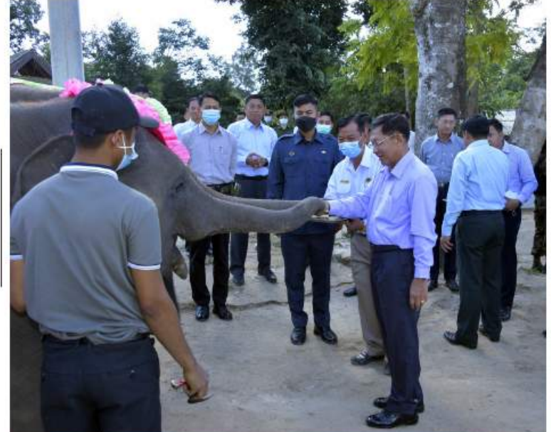
နိုင်ငံတော်စီမံအုပ်ချုပ်ရေးကောင်စီဥက္ကဋ္ဌ နိုင်ငံတော်ဝန်ကြီးချုပ် ဗိုလ်ချုပ်မှူးကြီးမင်းအောင်လှိုင် ဆင်ကလေးများကို အစာကျွေးစဉ်။