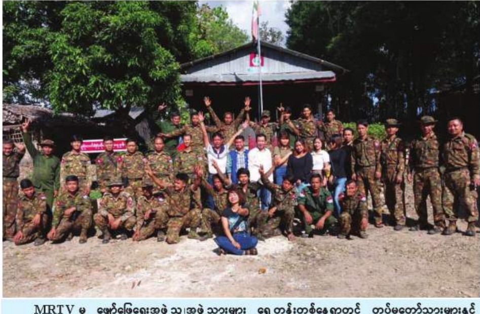
MRTV မှ ဖျော်ဖြေရေးအဖွဲ့၊ သူ့အဖွဲ့သားများ ရှေ့တန်းတစ်နေရာတွင် တပ်မတော်သားများနှင့် အမှတ်တရ စုပေါင်းဓာတ်ပုံ။