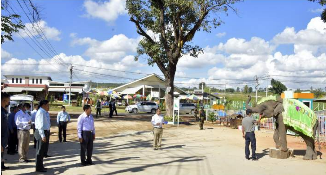
နိုင်ငံတော်စီမံအုပ်ချုပ်ရေးကောင်စီဥက္ကဋ္ဌ နိုင်ငံတော်ဝန်ကြီးချုပ် ဗိုလ်ချုပ်မှူးကြီးမင်းအောင်လှိုင် ဆင်ကလေးများ၏ ကျွမ်းကျင်မှုနှင့် အလှပြ ပြကွက်များကို ကြည့်ရှုအားပေးစဉ်။

၅၅၄ မီတာရှိ Sky Cable ကိုလည်း တည်ဆောက်လျက်ရှိပြီး မကြာမီအချိန် အတွင်းဖွင့်လှစ်နိုင်ရေးအတွက် ဆောင် ရွက်လျက်ရှိကြောင်း သတင်းရရှိသည်။