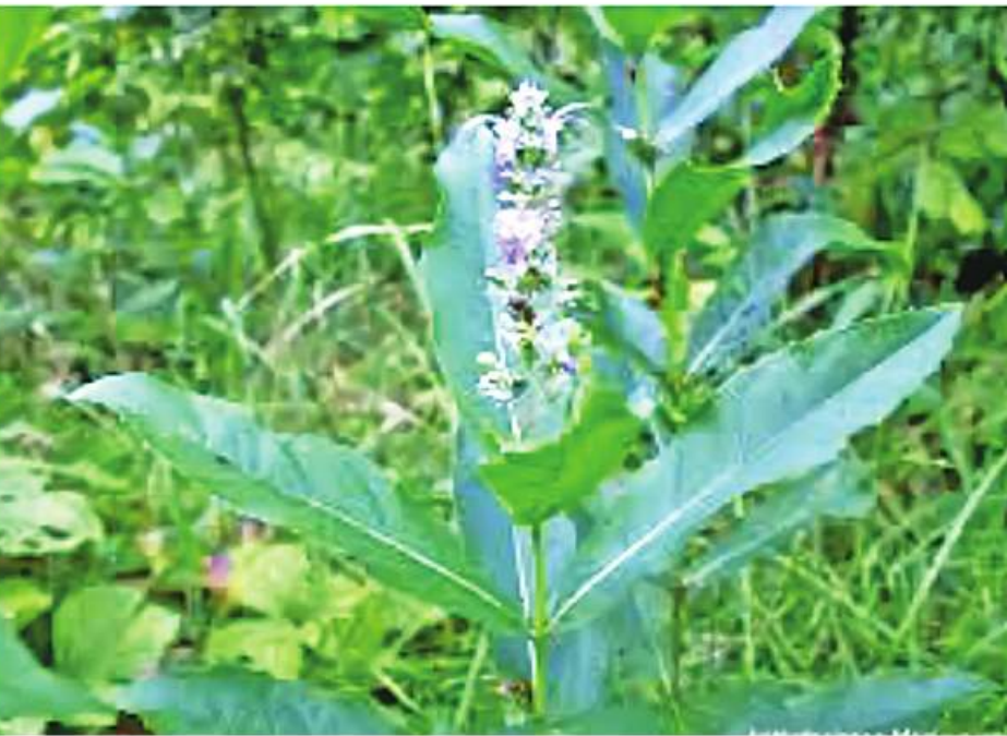
ဆေးဖက်ဝင် ရင်းပြားပင်ကို တွေ့ရစဉ်။

မေး ။ ။ ဆရာရှင် ကျွန်မအသက်က ၅၁ နှစ်ပါ။ ဒလမြို့မှာ နေပါတယ်။ လူကဝပါတယ် ဆရာ။ ဝမ်းက ချုပ်တတ်ပါတယ်။ ဆီးလဲ ကောင်းပါတယ်။ သားအိမ်ထုတ်တားတာ ဝန်ခံရလောက် ရှိပါပြီ။ ဒါကြောင့် သွေးဆုံး၊ မဆုံး မသိပါ။ ဒီအသက်လောက်ဆို ရောဂါဝေဒနာ တစ်ခုခုဖြစ်ရင် လူကြီးတွေက သွေးဆုံး ကိုင်တာလို့ ပြောကြပါတယ်။ ဆေးစားဖို့လိုသလားဆရာ။ ဘာကြောင့်လဲ တော့ မသိဘူး။ ရောဂါကြီးကြီးမားမား မဖြေပေမဲ့ လူက မကျန်းမာသလို ခံစားနေရပါတယ်။ အအေးဒဏ်ခံ