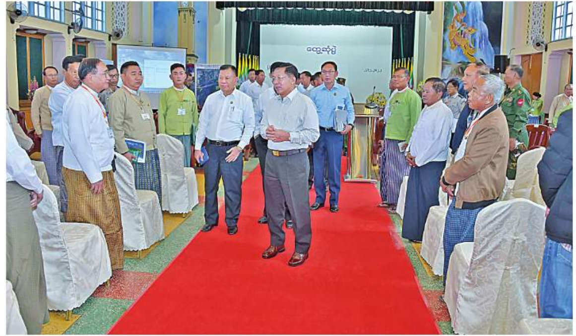
နိုင်ငံတော်စီမံအုပ်ချုပ်ရေးကောင်စီဥက္ကဋ္ဌ နိုင်ငံတော်ဝန်ကြီးချုပ် ဝိုလ်ချုပ်မှူးကြီးမင်းအောင်လှိုင် ပြင်ဦးလွင်မြို့ရှိ ကော်မီ လုပ်ငန်းရှင်များကို ရင်းလင်းနီးနီးနှုတ်ဆက်စဉ်။

ထို့နောက် နိုင်ငံတော်စီမံအုပ်ချုပ်ရေး ကောင်စီဥက္ကဋ္ဌ နိုင်ငံတော်ဝန်ကြီးချုပ်က အမှာစကားပြောကြားရာတွင် နိုင်ငံစီးပွား ဖွံ့ဖြိုးတိုးတက်ရေးအတွက် MSME လုပ်ငန်းများ ဖွံ့ဖြိုးတိုးတက်ရေး နိုင်ငံတစ်ဝန်း လိုက်လံကြည့်ရှုအားပေး ဆောင်ရွက်လျက်ရှိရာ ၁၀ ကြိမ်ခန့်ရှိပြီ ဖြစ်ကြောင်းနှင့် ယင်းလုပ်ငန်းတွင် တစ်ခု