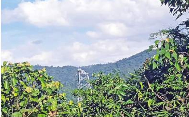
သက်နိုးညီနောင်မှ ကော့ကရိတ်မြို့နယ်နှင့် ကြာအင်းဆိပ်ကြီးမြို့နယ် တို့သို့ သွယ်တန်းထားသည့် ၆၆ ကေစီ မဟာဓာတ်အားလိုင်းမှ တာဝါတိုင်အမှတ်(၄၅) ပျက်စီးမှုမှတ်တမ်းဓာတ်ပုံ။

အထက်ပါဖြစ်စဉ်မှ အကြမ်းဖက်မှု လုပ်ရပ်များအား ကျူးလွန်ခဲ့သူများကို ဥပဒေနှင့်အညီ ထိရောက်စွာ အရေးယူ နိုင်ရေး လုံခြုံရေးတပ်ဖွဲ့ဝင်များက စုံစမ်း ဖော်ထုတ်လျက်ရှိကြောင်း သတင်း ရရှိသည်။