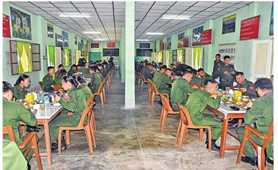
အလယ်ပိုင်းတိုင်းစစ်ဌာနချုပ်မှ တာဝန်ရှိသူများက နယ်မြေခံသင်တန်းကျောင်း၌ သင်တန်းသားများနှင့် အတူ ဂုဏ်ပြုစားပွဲ အတူတကွသုံးဆောင်စဉ်။