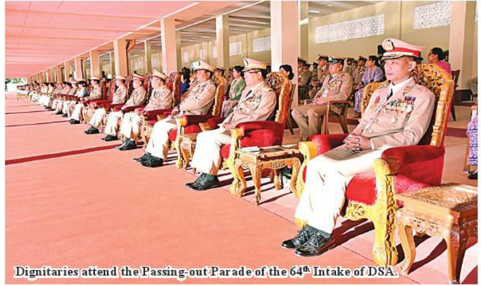
Dignitaries attend the Passing-out Parade of the 64 th Intake of DSA.

After taking salute from the cadet companies, the Senior General left the parade ceremony.