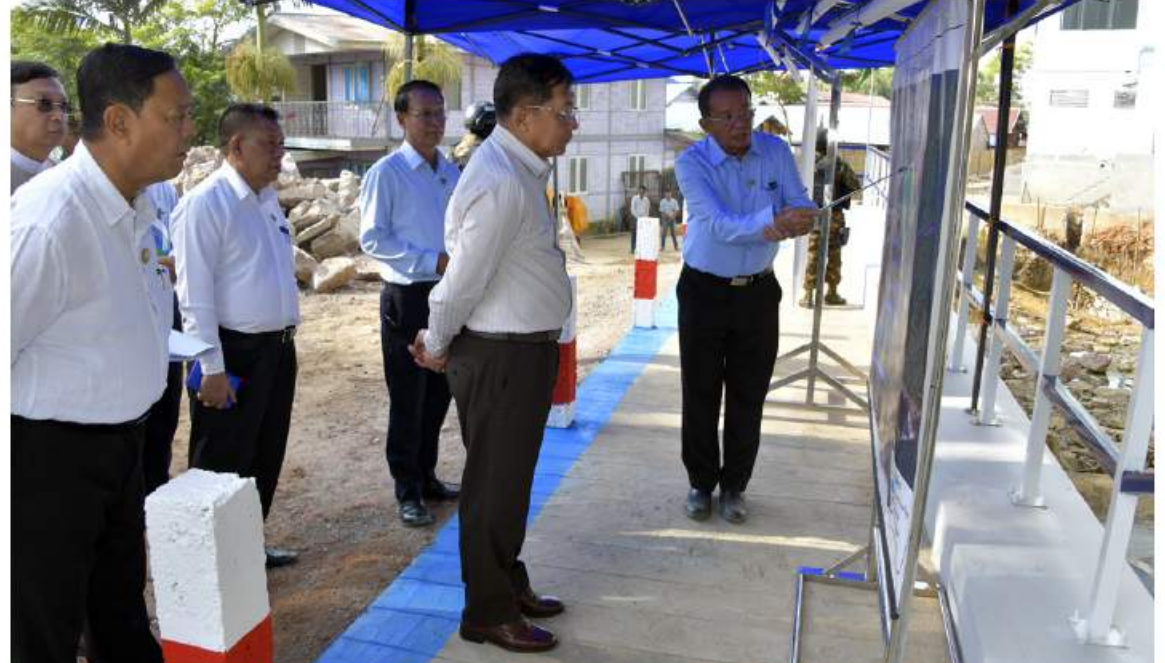
နိုင်ငံတော်စီမံအုပ်ချုပ်ရေးကောင်စီဥက္ကဋ္ဌ နိုင်ငံတော်ဝန်ကြီးချုပ် ဗိုလ်ချုပ်မှူးကြီးမင်းအောင်လှိုင်အား တာဝန်ရှိသူတစ်ဦးက ကန်တော်လေး ရေပိုလွှဲတိုးချဲ့တည်ဆောက်နေမှုအခြေအနေများနှင့်ပတ်သက်၍ ရှင်းလင်းတင်ပြစဉ်။