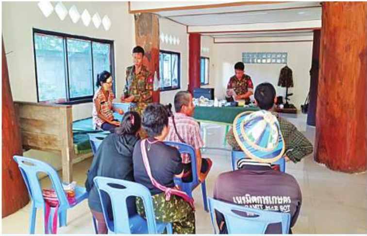
သေဘောဘိုးကျေးရွာနှင့် ဘလက်ဒိုကျေးရွာတို့သို့ ပြန်လည်ဝင်ရောက်လာသည့် ဒေသခံပြည်သူများကို တာဝန်ရှိသူများက ကျန်းမာရေးစောင့်ရှောက်မှုလုပ်ငန်းများ ဆောင်ရွက်ပေးစဉ်။

နေပြည်တော် ၁ ဇူလိုင် ၂၀၂၂ ကရင်ပြည်နယ်အတွင်းရှိ ဖလူး၊ ကျောက်ခက်၊ သေဘောဘိုး၊ ဝေါလေဒေသ တစ်ဝိုက်နှင့် မြဝတီ-ဝေါလေကားလမ်း တစ်လျှောက်ရှိ KNU၊ KNLA မှ အကြမ်းဖက်မှုကိုလိုလားသော အဖွဲ့၊ NUG အဖွဲ့နှင့် ၎င်း၏လက်ဝဲခံ PDF အမည်ခံ အကြမ်းဖက်သမားများက ယခုနှစ်မေလမှ စတင်ထိန်းချုပ်၍ အဆိုပါဒေသတစ်ဝိုက်ရှိ လူနေအိမ်များဘာသာရေးဆိုင်ရာအဆောက် အအုံများ၊ စာသင်ကျောင်းများအတွင်း ဝင်ရောက်နေထိုင်ကာ အဖျက်အမှောင့် လုပ်ငန်းများ လုပ်ဆောင်ခြင်း၊ ခြိမ်းခြောက် ခြင်းများကြောင့် ဒေသခံတိုင်းရင်းသားများ အနေဖြင့် ဘေးလွတ်ရာနေရာများသို့ခေတ္တ ထွက်ပြေးတိမ်းရှောင်လျက်ရှိသည်။