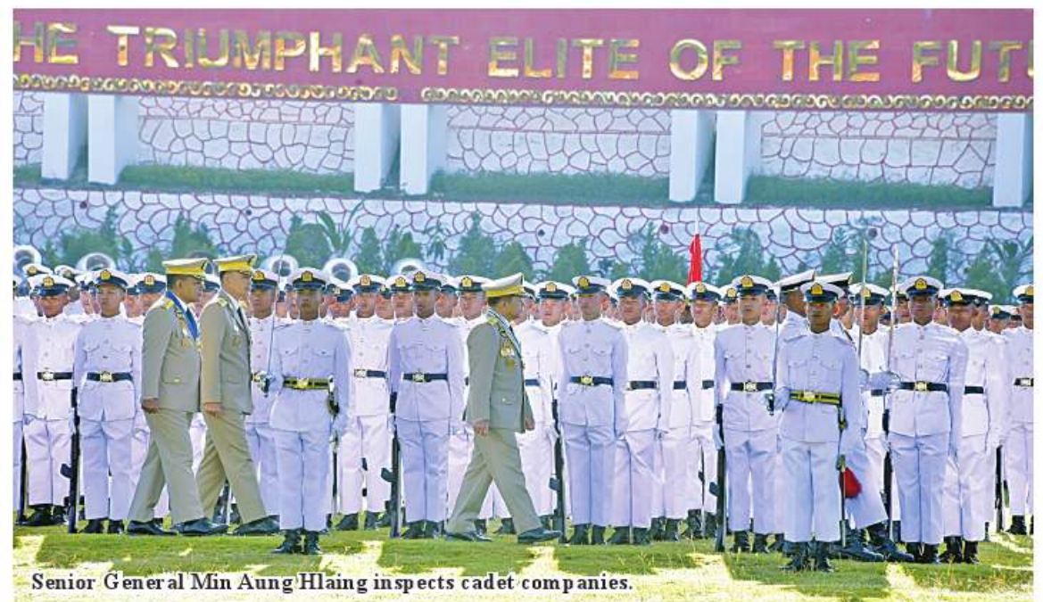
Senior General Min Aung Hlaing inspects cadet companies.

According to Section 20 (f) 2008 Constitution, Tatmadaw is mainly