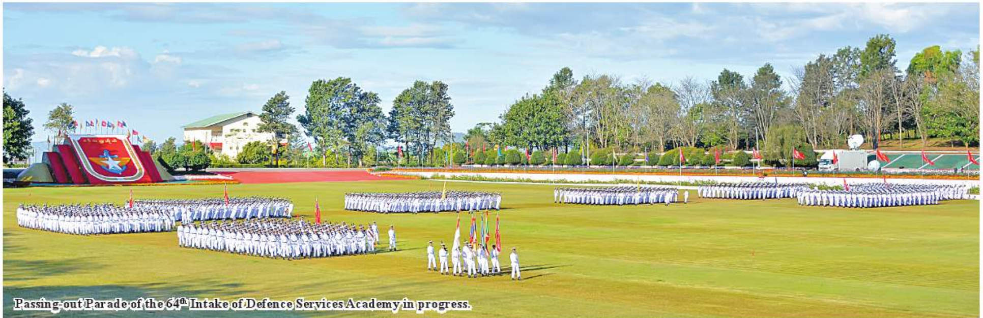
Passing-out Parade of the 64 th Intake of Defence Services Academy in progress.