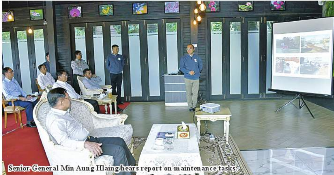
Senior General Min Aung Hlaing hears report on maintenance tasks.