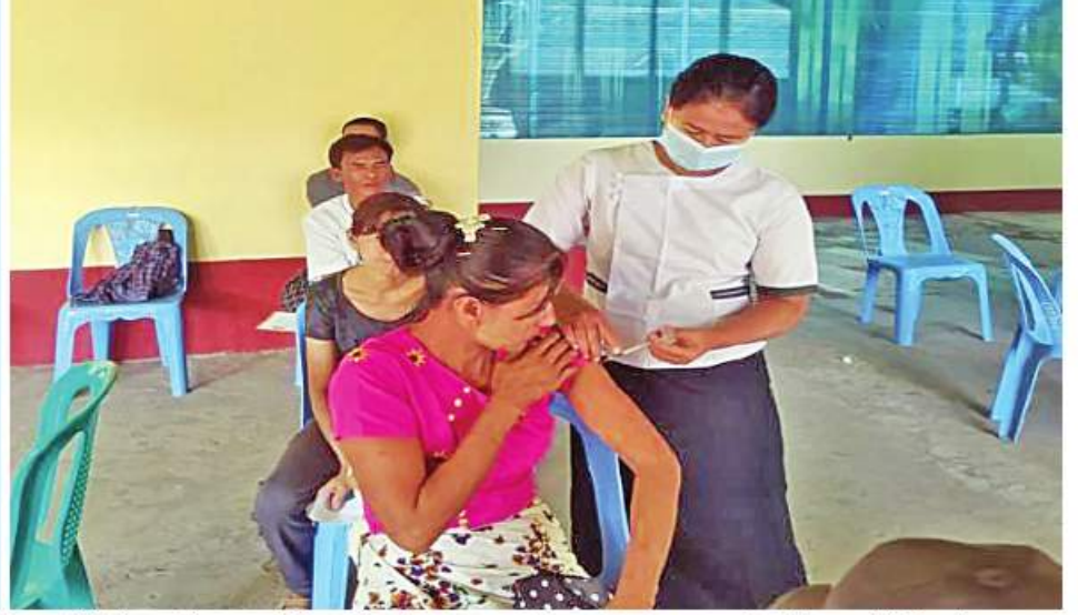
ဧရာဝတီတိုင်းဒေသကြီး ဟင်္သာတမြို့နယ် အတွင်းရှိ ဒေသခံပြည်သူများကို ကိုဗစ်-၁၉ ရောဂါ ကာကွယ်ဆေးများ ထိုးနှံပေးစဉ်။

ထို့အတူ ကျောင်းသား၊ ကျောင်းသူများကိုလည်း ကိုဗစ်-၁၉ ရောဂါ ကာကွယ်ဆေးများထိုးနှံပေးလျက်ရှိရာ ယနေ့တွင် မန္တလေးတိုင်းဒေသကြီးအတွင်းရှိ ခရိုင်ခုနစ်ခုတို့၌ ကျောင်းသား၊ ကျောင်းသူ ၂၉၆ ဦးတို့ကို တပ်မတော်မှဆေးအဖွဲ့များက ပြည်သူ့ဆေးရုံများမှ ဆရာဝန်များ၊ သက်ဆိုင်ရာ ကျန်းမာရေးဝန်ထမ်းများ၊ စေတနာ့ဝန်ထမ်းများနှင့်ပူးပေါင်း၍ ကိုဗစ်-၁၉ ရောဂါ ကာကွယ်ဆေးထိုးနှံပေးခြင်းများ ဆောင်ရွက်ပေးသည်။ ထို့ပြင် ကိုဗစ်-၁၉ ရောဂါ ထိန်းချုပ်ကာကွယ်ရာတွင် အထောက်အကူဖြစ်စေရန်အတွက် Mask များကို ပြည်သူများ လက်ဝယ်အရောက် တိုင်းစစ်ဌာနချုပ်အသီးသီးမှ တာဝန်ရှိသူများက အခမဲ့ပေးဝေလျှော့ဒါနလျက်ရှိရာ ယနေ့တွင် ရန်ကင်းတိုင်းဒေသကြီးအတွင်းရှိ မြို့နယ် ၄၄ မြို့နယ်တို့မှ စာသင်ကျောင်းများ၊