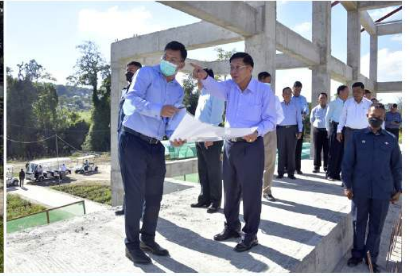
နိုင်ငံတော်စီမံအုပ်ချုပ်ရေးကောင်စီဥက္ကဋ္ဌ နိုင်ငံတော်ဝန်ကြီးချုပ် ဗိုလ်ချုပ်မှူးကြီးမင်းအောင်လှိုင် Sky Cable တည်ဆောက်နေမှုအား ကြည့်ရှုစစ်ဆေးစဉ်။

စာမျက်နှာ ၂၂ မှအဆက် ကန်ရေအနက် ၁၆ ပေသာရှိခဲ့ရာမှ ယခုအခါတွင် ၃၁ ဒသမ ၈ ပေသို့ ရောက်ရှိလာပြီဖြစ်ကြောင်းနှင့် ကန်အမှတ် ၁ တွင် ရေပြည့်အမှတ် ၆ ပေရှိသည့် အနက် လက်ရှိရေအမှတ် ၆ ဒသမ ၅ ပေ၊ ကန်အမှတ် ၂ တွင် ရေပြည့်အမှတ် ၇ ပေရှိသည့်အနက် လက်ရှိရေအမှတ် ၇ ပေ၊ ကန်အမှတ် ၃ တွင် ရေပြည့်အမှတ် ၁၁ ပေရှိသည့်အနက် လက်ရှိရေအမှတ် ၈ ဒသမ ၈ ပေရှိကြောင်း သိရှိရပြီး ရေ အရင်းအမြစ် ထိန်းသိမ်းရေးလုပ်ငန်းများကို ဆက်လက်ဆောင်ရွက်လျက်ရှိသည်။ ထို့ပြင် နိုင်ငံတော်စီမံအုပ်ချုပ်ရေး ကောင်စီဥက္ကဋ္ဌ နိုင်ငံတော်ဝန်ကြီးချုပ်နှင့် အဖွဲ့ဝင်များသည် ဒီဇင်ဘာ ၁ ရက် နံနက်ပိုင်းတွင်လည်း ပွဲကောက်ရေတံခွန် အပန်းဖြေစခန်း (B.E FALLS) သို့ ရောက်ရှိကြရာ တာဝန်ရှိသူများက ကြိုဆို နှုတ်ဆက်ကြသည်။ ထို့နောက် မြန်မာစီးပွားရေးကော်ပို ရေးရှင်းဥက္ကဋ္ဌ ဒုတိယဗိုလ်ချုပ်ကြီးညိုစော က ပွဲကောက်ရေတံခွန်အပန်းဖြေစခန်း (B.E FALLS) သမိုင်းအကျဉ်း၊ လုပ်ငန်း ဆောင်ရွက်နေမှုအခြေအနေများ၊ အများ ပြည်သူများ လာရောက်အပန်းဖြေမှုအခြေ အနေများ၊ တောတွင်းလျှောက်လမ်းများ တိုးချဲ့ရန် ဆောင်ရွက်နေမှုနှင့် Sky Cable တည်ဆောက်နေမှု အခြေအနေများကို ရှင်းလင်းတင်ပြရာ နိုင်ငံတော်စီမံ အုပ်ချုပ်ရေးကောင်စီဥက္ကဋ္ဌ နိုင်ငံတော် ဝန်ကြီးချုပ်က အပန်းဖြေစခန်းအတွင်း ပြည်သူများ စိတ်ချမ်းမြေ့စွာအပန်းဖြေ အနားယူနိုင်ရေးအတွက် အမြဲသန့်ရှင်း