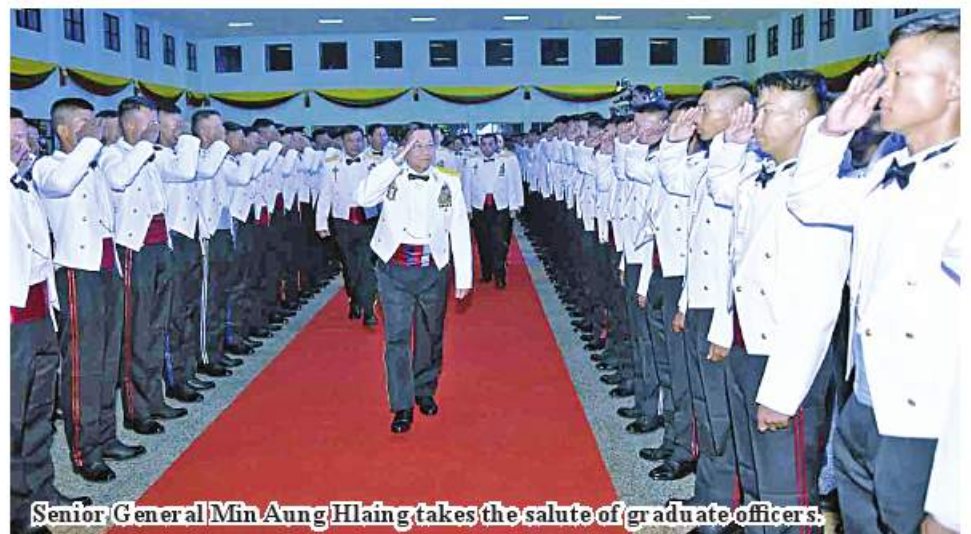
Senior General Min Aung Hlaing takes the salute of graduate officers.

First, the Senior General cordially greeted the individ-