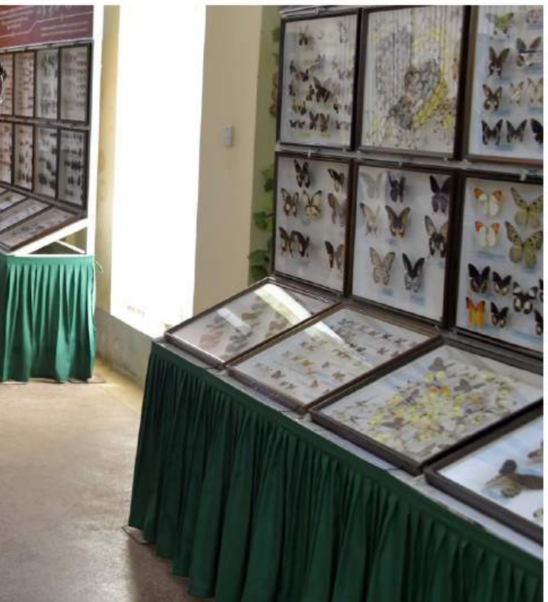
နိုင်ငံတော်စီမံအုပ်ချုပ်ရေးကောင်စီဥက္ကဋ္ဌ နိုင်ငံတော်ဝန်ကြီးချုပ် ဗိုလ်ချုပ်မှူးကြီးမင်းအောင်လှိုင် အမျိုးသားကန်တော်ကြီး ဥယျာဉ်အတွင်း လှည့်လည်ကြည့်ရှုစဉ်။

log house၊ coffee shop၊ တောတွင်း လျှောက်လမ်းများ၊ အပန်းဖြေနေရာများ၊ ကလေးကစားကွင်းများ စသည်တို့ကို ပြည့်စုံအောင်ထည့်သွင်း အဆင့်မြှင့်တင် ထားရှိသည့်အပြင် ယခုအခါတွင် အရှည်