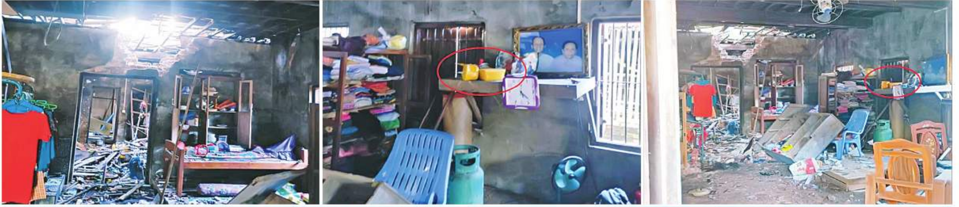
PDF အမည်ခံအကြမ်းဖက်သမားများက ပုလောမြို့နယ် ပလမြို့ အမှတ်(၃)ရပ်ကွက်၌ ရွှေထည်ပစ္စည်းများ၊ ငွေကြေးများကို သေနတ်ပြခြိမ်းခြောက်ယူဆောင်ခဲ့ပြီး နေအိမ်ကို မိုင်းခွဲဖျက်ဆီးခဲ့ကာ မိုင်းနစ်လုံး ထောင်ထားခဲ့မှုကို တွေ့မြင်ရစဉ်။

နေပြည်တော် ခိုဝင်ဘာ ၂၆ တနင်္သာရီတိုင်းဒေသကြီး ပုလောမြို့နယ် ပလမြို့ အမှတ်(၃)ရပ်ကွက် ရပ်ကွက်အုပ်ချုပ်ရေးမှူးနေအိမ်မှ ရွှေထည်ပစ္စည်းမျိုးစုံ အလေးချိန် ၁၆ ကျပ် ၁ မတ်သားခန့်နှင့် ငွေကျပ်သိန်း ၃၀ ခန့်တို့ကို PDF အမည်ခံအကြမ်းဖက်သမားများက သေနတ်ပြခြိမ်းခြောက်ယူဆောင်