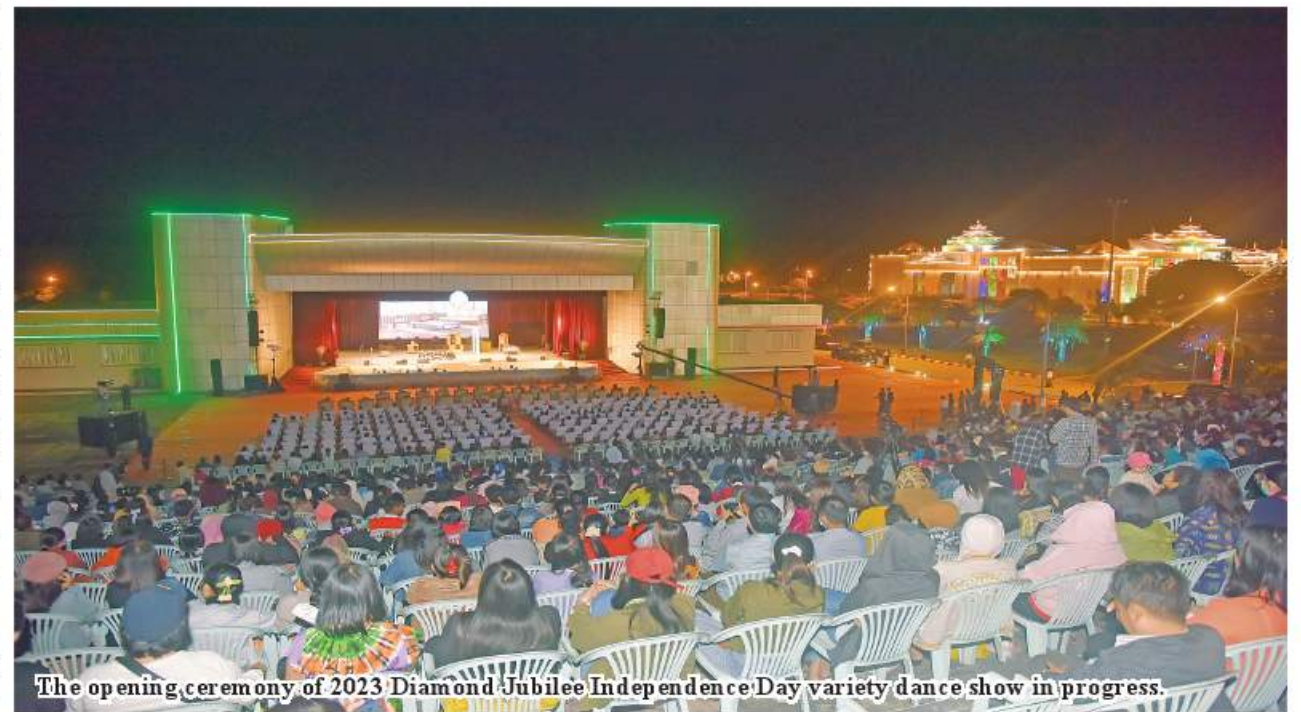
The opening ceremony of 2023 Diamond Jubilee Independence Day variety dance show in progress.