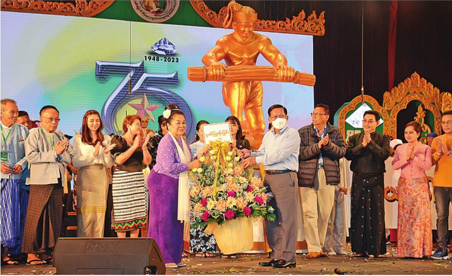
နိုင်ငံတော်စီမံအုပ်ချုပ်ရေးကောင်စီဥက္ကဋ္ဌ နိုင်ငံတော်ဝန်ကြီးချုပ် ပိုလ်ချုပ်မှူးကြီးမင်းအောင်လှိုင် ၂၀၂၃ ခုနှစ် စိန်ရတုလွတ်လပ်ရေးနေ့ ပဒေသာကပွဲတွင် ပါဝင်သီဆိုကပြပျော်ဖြေခဲ့ကြသည့် အနုပညာရှင်များကို ဂုဏ်ပြုပန်းခြင်းပေးအပ်ချီးမြှင့်စဉ်။

၂၀၂၃ ခုနှစ် စိန်ရတုလွတ်လပ်ရေးနေ့ ပဒေသာကပွဲဖွင့်ပွဲအခမ်းအနားသို့ တက်ရောက်အားပေးကြည့်ရှု