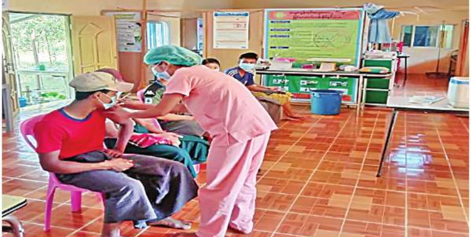
ဧရာဝတီတိုင်းဒေသကြီး ကျောင်းကျန်းမြို့နယ်အတွင်းရှိ ဒေသခံပြည်သူများကို ကိုဗစ်-၁၉ ရောဂါ ကာကွယ်ဆေးများ ထိုးနှံပေးစဉ်။

နေပြည်တော် နိုဝင်ဘာ ၂၆ ကိုဗစ်-၁၉ ရောဂါ ကာကွယ် ထိန်းချုပ် ကုသရေးဆောင်ရွက်ရာတွင် ကာကွယ်ဆေး ထိုးနှံခြင်းသည် အဓိကအခန်းကဏ္ဍတွင် ပါဝင်သည့် လုပ်ငန်းတစ်ရပ်ဖြစ်သောကြောင့် တိုင်းဒေသကြီးနှင့် ပြည်နယ်အသီးသီးတို့၌ ကာကွယ်ဆေးထိုးနှံခြင်းကို အင်တိုက် အားတိုက်ဆောင်ရွက်လျက်ရှိရာ ယနေ့ တွင် ဧရာဝတီတိုင်းဒေသကြီးအတွင်းရှိ မြို့နယ် ၂၆ မြို့နယ်၌ ဒေသခံပြည်သူ