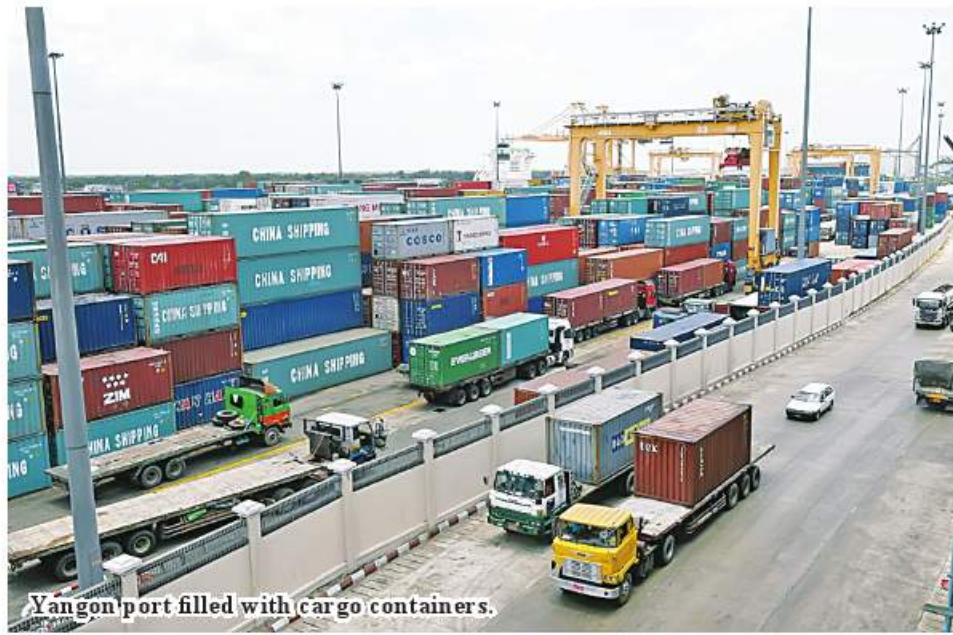
Yangon port filled with cargo containers.

Nay Pyi Taw November 26 Myanmar imported raw materials worth US$4,934 million from 1 April to 11 November in the current 2022-2023 fiscal year, said U Nanda, director of the Trade Department under the Ministry of Commerce. In the period, raw materials worth over US$72 million were imported by the State sector and US$4,862 million by the private sector. "The country imported raw materials for agricultural, construction and industrial sectors from around 20 countries. From 1 April to 11 November this FY, the amount of imported goods was US$4,934 million. In the same period of last fiscal, the amount was just US$3,138 million. So we saw the exceeding amount of over US$1,790 million. Such an increase is seen as business operations get higher," U Nanda said. Myanmar imports textile, fuel oil and accessories for industries, cement and materials for construction, fertilizers and pesticides for agriculture and wheat and cooking oil for the foodstuff industry. The import of oil and oil products tops all of imports.