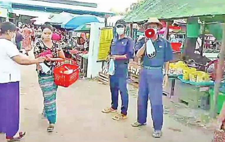
ရန်ကုန်တိုင်းဒေသကြီးအတွင်း၌ တာဝန်ရှိသူများက ဒေသခံပြည်သူများကို Mask များ အခမဲ့ ပေးဝေလျှော့ဒါန်းစဉ်။

များ ထိုးနှံပေးလျက်ရှိရာ ယနေ့တွင် မန္တလေးတိုင်းဒေသကြီးအတွင်းရှိ ခရိုင် ခုနစ်ခုတို့၌ ကျောင်းသား၊ ကျောင်းသူ ဦးရေ ၃၉၀ တို့ကို တပ်မတော်မှ ဆေးအဖွဲ့များက ပြည်သူ့ဆေးရုံများမှ ဆရာဝန်များ၊ သက်ဆိုင်ရာ ကျန်းမာရေး ဝန်ထမ်းများ၊ စေတနာ့ဝန်ထမ်းများနှင့် ပူးပေါင်း၍ ကိုဗစ်-၁၉ ရောဂါ ကာကွယ် ဆေးထိုးနှံပေးခြင်းများ ဆောင်ရွက်ပေးသည်။ ထို့ပြင် ကိုဗစ်-၁၉ ရောဂါ ထိန်းချုပ်