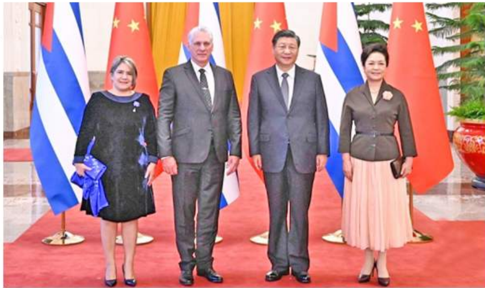
ပေကျင်း နိုဝင်ဘာ ၂၆

တရုတ်သမ္မတ ရှီကျင့်ဖျင်နှင့် ကျူးဘားသမ္မတ မိဂွဲလိဒီအက်ဂ် ကာနယ်လ်တို့သည် နိုဝင်ဘာ ၂၅ ရက်တွင် တရုတ်နိုင်ငံ ပေကျင်းမြို့၌ တွေ့ဆုံဆွေးနွေးခဲ့ကြကြောင်း အေပီသတင်းဌာနက ဖော်ပြခဲ့သည်။