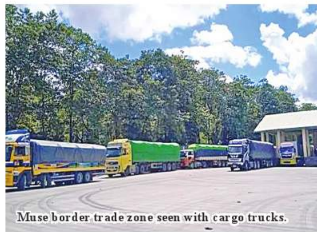
Muse border trade zone seen with cargo trucks.

exports agricultural products such as rice, broken rice, beans and pulses and foodstuffs to China and imports electrical goods, construction materials, household utensils and industrial goods. ASH