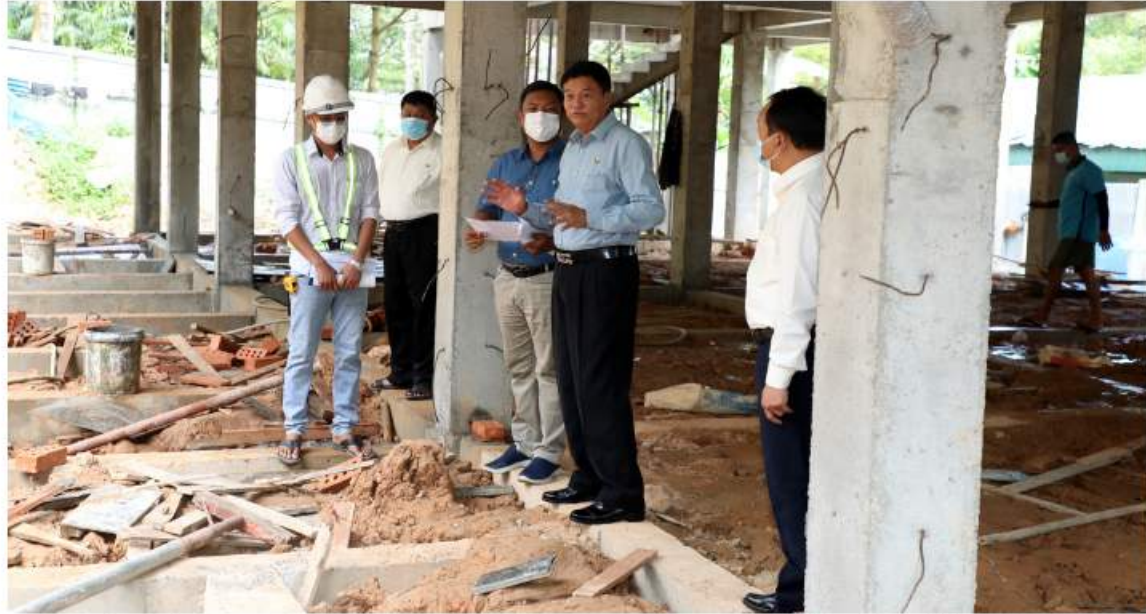
ရန်ကုန် နိုဝင်ဘာ ၂၆

အားကစားနှင့် လူငယ်ရေးရာဝန်ကြီးဌာန ပြည်ထောင်စုဝန်ကြီး ဦးမင်းသိန်းဝံသည် တာဝန်ရှိသူများနှင့်အတူ ယနေ့တွင် မြန်မာနိုင်ငံ လေ့လျော်အဖွဲ့ချုပ်သို့ ရောက်ရှိပြီး ခြောက်ခန်းတွဲ လေးထပ် အားကစားသမား အိပ်ဆောင်ဆောက်လုပ်နေမှုကိုကြည့်ရှုစစ်ဆေးပြီး လိုအပ်သည်များမှာကြားသည်။