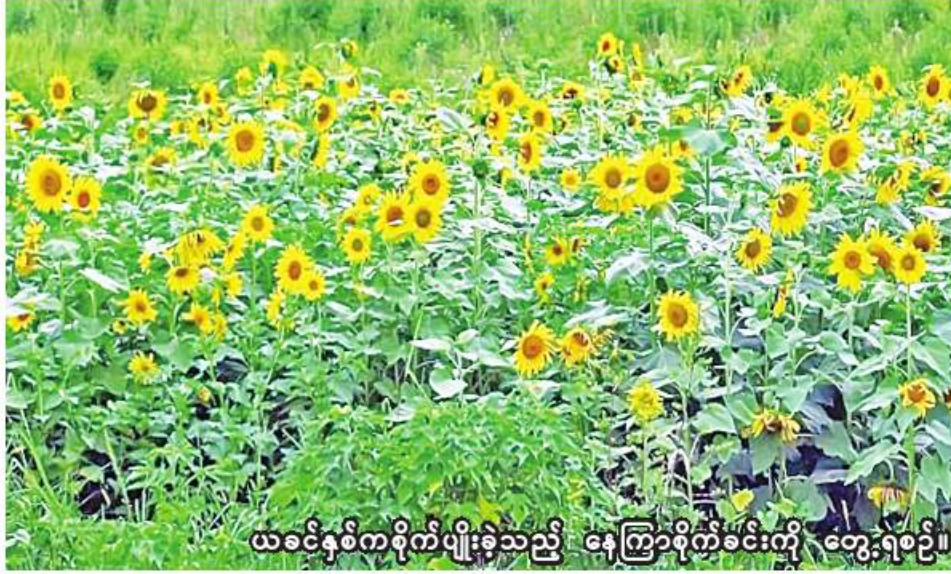
ယခင်နှစ်ကစိုက်ပျိုးခဲ့သည့် နေကြာစိုက်ခင်းကို တွေ့ရစဉ်။

ဒေးဒရဲ နိုဝင်ဘာ ၂၆ ဧရာဝတီတိုင်းဒေသကြီး ဒေးဒရဲမြို့နယ်တွင် ယခုနှစ် ဆောင်းသီးနှံ စိုက်ပျိုးရာသီ၌ ဆီထွက်သီးနှံ နေကြာကေ ၃၀၀ ကို နိုဝင်ဘာလ တတိယပတ်က စတင်စိုက်ပျိုးလျက် ရှိကြောင်း ဒေးဒရဲမြို့နယ် စိုက်ပျိုးရေးဦးစီးဌာနမှ သိရသည်။