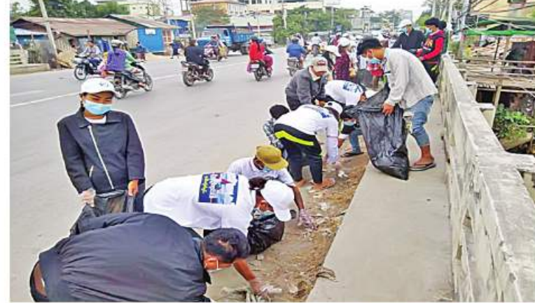
မန္တလေးတိုင်းဒေသကြီး မန္တလေးမြို့ပေါ်ရှိ တာဝန်သိ လူငယ်လူရွယ်များစုစည်း၍ “မြို့ရွာသန့်ရှင်း ရောဂါကင်း၊ ဖုပေါင်းအမှိုက်ရှင်း” စာသားတံဆိပ်ပါ တူညီဝတ်စုံ များ ဝတ်ဆင်ပြီး ဖုပေါင်းသန့်ရှင်းရေးပြုလုပ်နေမှုကို တွေ့ရစဉ်။

ခြင်ဆေးဖျန်းပေးခြင်းတို့ကို ဆောင်ရွက် ပေးကြသည်။ ထို့ပြင် မန္တလေးမြို့ပေါ်ရှိ တာဝန်သိ လူငယ်လူရွယ်များ စုစည်း၍ “မြို့ရွာ သန့်ရှင်းရေးဂရုကင်း၊ ဖုပေါင်းအမှိုက်ရှင်း” စာသားတံဆိပ်ပါ တူညီဝတ်စုံများဝတ်ဆင် ပြီး ချမ်းမြသာစည်မြို့နယ် ၆၉ လမ်း မနော်ဟရီလမ်းမှ ၄၄ လမ်းကြားနှင့် ၁၁၁ လမ်းထိ အမှိုက်ကောက်ခြင်းနှင့် ရပ်ကွက်နေပြည်သူများ တစ်ဖက်တစ်လမ်း မှ သက်သာချောင်ချိမှုရှိစေရန် ပြည်သူများ ထံမှ အမှိုက်တစ်ပိဿာလျှင် ၁၀၀ ကျပ်ဖြင့် ဝယ်ယူပေးခဲ့ကြောင်း သိရသည်။ ယင်းသို့ ဆောင်ရွက်ပေးနေမှုများကို သက်ဆိုင်ရာ တိုင်းဒေသကြီးနှင့် ပြည်နယ် များမှ ဝန်ကြီးချုပ်များ၊ တိုင်းစစ်ဌာန ချုပ်များမှ တိုင်းမှူးများနှင့် ဌာနဆိုင်ရာ တာဝန်ရှိသူများက လိုက်လံကြည့်ရှု အားပေးပြီး လိုအပ်သည်များ ညှိနှိုင်း ဆောင်ရွက်ပေးခဲ့ကြကြောင်း သတင်း ရရှိသည်။