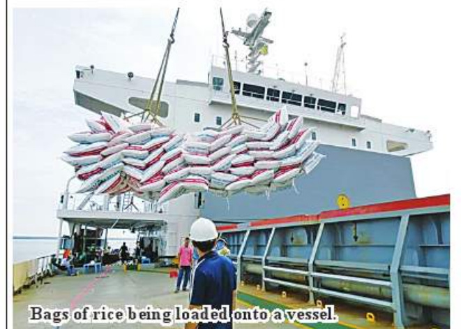
Bags of rice being loaded onto a vessel.

passengers and commodities leading to Shwegu and Bhamo. Most of them are traders. They carry onion from Mandalay to Shwegu, Katha and Bhamo," he add. Some 50 passengers to Shwegu, Katha and Bhamo took vessel till the first week of November at Chaw jetty. As of 22 November, more than 200 travellers take vessels on a daily basis. "More than 300 freight handling workers are serving at Chaw jetty due to arrivals of heavy loads. Most of commodities are onion, rice and gram," he continued. More than 150 vessels centre at Chaw jetty for transport of passengers and commodities on a daily basis. 184