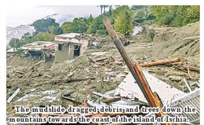
The mudslide dragged debris and trees down the mountains towards the coast of the island of Ischia.

Heavy rains have been battering Campania, the region surrounding Naples and Ischia, for several days. A weather warning for rainfall and strong winds is in place until Sunday.