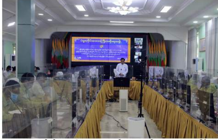
ပဲခူး နိုဝင်ဘာ ၂၆

နိုင်ငံစီးပွားမြှင့်တင်ရေး ရန်ပုံငွေဖြင့် ပဲခူးတိုင်းဒေသကြီးအတွင်းရှိ ဆောင်းပဲတီစိမ်း နှင့် နွေစပါးစိုက်တောင်သူများအတွက် လိုအပ်သည် မျိုးကောင်းမျိုးသန့်များ