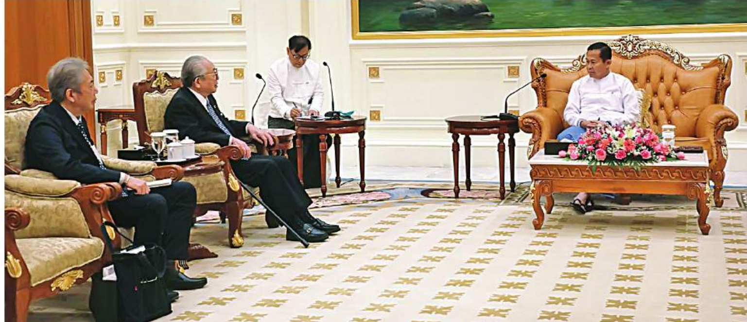
နိုင်ငံတော်စီမံအုပ်ချုပ်ရေးကောင်စီဒုတိယဥက္ကဋ္ဌ ဒုတိယဝန်ကြီးချုပ် ဒုတိယဗိုလ်ချုပ်မှူးကြီးစိုးဝင်း၊ ဂျပန်-မြန်မာချစ်ကြည်ရေးအသင်းဥက္ကဋ္ဌ Mr.Hideo Watanabe ကို လက်ခံတွေ့ဆုံစဉ်။

နေပြည်တော် နိုဝင်ဘာ ၂၅ နိုင်ငံတော်စီမံအုပ်ချုပ်ရေးကောင်စီ ဒုတိယဥက္ကဋ္ဌ ဒုတိယဝန်ကြီးချုပ် ဒုတိယ ဗိုလ်ချုပ်မှူးကြီးစိုးဝင်းသည် ဂျပန်- မြန်မာချစ်ကြည်ရေးအသင်းဥက္ကဋ္ဌ Mr. Hideo Watanabe ကို ယနေ့နံနက်ပိုင်း တွင် နေပြည်တော်ရှိ နိုင်ငံတော်စီမံ အုပ်ချုပ်ရေးကောင်စီရုံးဧည့်ခန်းမဆောင် ခွဲ လက်ခံတွေ့ဆုံသည်။ ထိုသို့တွေ့ဆုံရာတွင် ဂျပန်-မြန်မာ ချစ်ကြည်ရေးအသင်းကြီးမှ ဆက်လက် ပူးပေါင်းဆောင်ရွက်မှုအခြေအနေများ၊ သီလဝါအထူးစီးပွားရေးဇုန် ဖွံ့ဖြိုးတိုး တက်ရေးအတွက် ဆောင်ရွက်လျက်ရှိမှု အခြေအနေများ၊ ပြည်တွင်းပြည်ပနိုင်ငံ ရေး၊ စီးပွားရေးဆိုင်ရာအခြေအနေများ၊ ဂျပန်နိုင်ငံမှ စီးပွားရေးရင်းနှီးမြှုပ်နှံမှုများ စာမျက်နှာ ၁၈ ကော်လံ ၁ ☆