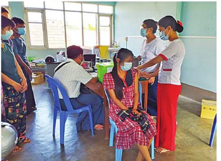
ကျောင်းကျန်းမြို့နယ်၌ ဒေသခံပြည်သူများကို ကိုဗစ်-၁၉ ရောဂါ ကာကွယ်ဆေးများ ထိုးနှံပေးစဉ်။