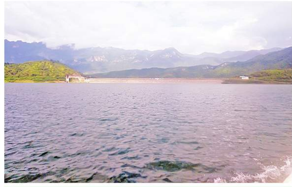
သာယာလှပနေသော ကင်းတားဆည်

ကားရပ်ထားခဲ့တဲ့ မောနားတောင်ကိုရောက်မှ မနက်ကတည်းက ချက်ပြုတ်ယူဆောင်လာကြတဲ့