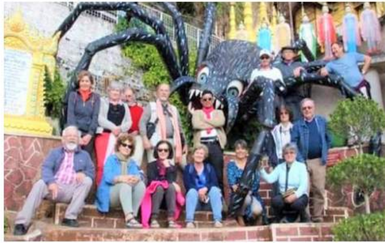
ရန်ကုန် နိုဝင်ဘာ ၂၅ ၂၀၂၂ ခုနှစ်တွင် အခါကြီးရက်ကြီး ရုံးပိတ်ရက်တို့၌ ပြည်တွင်းခရီးသွားများ ပြန်လည်စည်ကားမှုဖြင့် ခရီးသွားလုပ်ငန်းများပြန်လည်စတင်နိုင်ခဲ့ပြီး ပြည်ပခရီးသွားလုပ်ငန်းအချို့လည်း ပြည်လည်အစပျိုးနိုင်ခဲ့ရာ ၂၀၂၃ ခုနှစ်၏ ခရီးသွားရာသီအဖွင့်သည် ကောင်းမွန်နေမည်ဟုမျှော်မှန်းထား

ကြောင်း သိရသည်။ အချိန်ရစပြုနေသော ခရီးသွားလုပ်ငန်းကို နှစ်ကူးကာလမှစ၍ အချိန်မြင့်တင်ဆောင်ရွက်နိုင်ရန် သက်ဆိုင်ရာခရီးသွားဝင်ရောက်ရာဒေသတို့ရှိ ခရီးသွားကုမ္ပဏီများအနေဖြင့် ကြိုတင်ပြင်ဆင်ထားရန် လိုအပ်ပြီး နှစ်သစ်ကူးကာလမှစ၍ သင်္ကြန်ကာလထိ ပြည်တွင်း၊ ပြည်ပခရီးသွားများ ဝင်ရောက်တတ်မှုကြောင့် မြန်မာ့ခရီးသွားလုပ်ငန်းပြန်လည်ဦးမော့ရန် မြန်မာနိုင်ငံခရီးသွားလုပ်ငန်းရှင်များ မျှော်မှန်းလျက်ရှိသည်။ ပွင့်လင်းရာသီအစ နိုဝင်ဘာလတွင် နိုင်ငံခြားခရီးသွားအချို့ ဝင်ရောက်ခဲ့ပြီး မြန်မာနိုင်ငံ၏ အထင်ကရနေရာများဖြစ်သော ရန်ကုန်၊ မန္တလေး၊ ပုဂံ၊ တောင်ကြီး၊ အင်းလေး၊ ပင်းတယ၊ ပြင်ဦးလွင်၊ မြိတ်ကျွန်းစုများနှင့် ပင်လယ်ကမ်းခြေ အပန်းဖြေခန်းများသို့