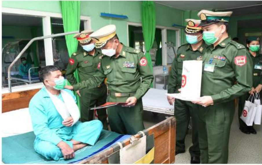
ရန်ကုန်တိုင်းစစ်ဌာနချုပ် တိုင်းမှူး ဗိုလ်ချုပ်ညွန့်ဝင်းဆွေ တပ်မတော်ဆေးရုံ၌ ဆေးကုသမှု ခံယူနေသူတစ်ဦးကို ရင်းရင်းနှီးနှီးစောင့်ရှောက်ပေးစကား ပြောကြားစဉ်။

တပ်ဖွဲ့ဝင်များနှင့် ဒေသခံပြည်သူများကို ယနေ့တွင် သက်ဆိုင်ရာတိုင်းစစ်ဌာနချုပ် အသီးသီးမှ တိုင်းမှူးများနှင့် အဖွဲ့ဝင်များက သွားရောက်ကြည့်ရှု၍ တစ်ဦးချင်း၏ ရောဂါဖြစ်ပွားမှု၊ ဆေးကုသပေးထားမှုနှင့် ဒေသခံပြည်သူများကို ကျန်းမာရေးတိုးတက်မှု အခြေအနေများကို ထို့နောက် တိုင်းမှူးများနှင့် အဖွဲ့ဝင်များသည် ဆေးရုံများအတွင်း လှည့်လည် ပြောကြားပြီး ဆေးရုံတက်လူနာများကို ကြည့်ရှုပြီး လိုအပ်သည်များ ညှိနှိုင်း အာဟာရဖြည့်စားသောက်ဖွယ်ရာများနှင့် ဆောင်ရွက်ပေးခဲ့ကြကြောင်း သတင်း ထောက်ပံ့ငွေများ ပေးအပ်သည်။ ရရှိသည်။