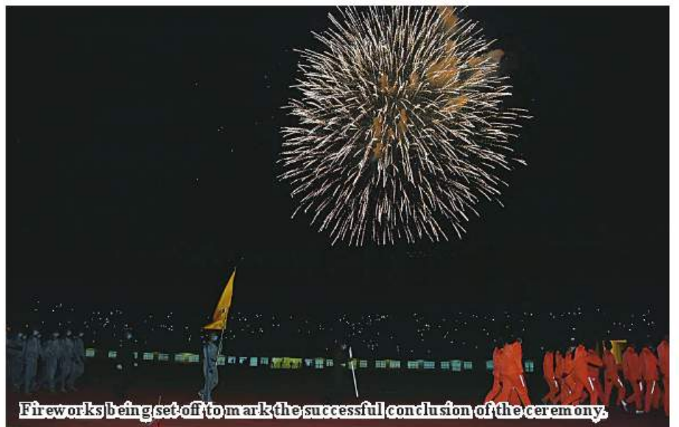
Fireworks being set off to mark the successful conclusion of the ceremony.