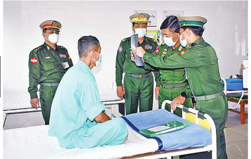
ကာကွယ်ရေးဦးစီးချုပ်ရုံး(ကြည်း)မှ ဒုတိယဗိုလ်ချုပ်ကြီးအောင်အောင်နှင့် အရှေ့ပိုင်းတိုင်းစစ်ဌာနချုပ် တိုင်းမှူး ဗိုလ်ချုပ်လှမိုးတို့ လျှိုင်ကော်မတီဖြင့် နယ်မြေခံတပ်မတော်ဆေးရုံ၌ ဆေးကုသမှုခံယူနေသူတစ်ဦးကို ရင်းရင်းနှီးနှီးစောင့်ရှောက်ပေးစကားပြောကြားစဉ်။