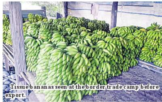
Tissue bananas seen at the border trade camp before export.

the tax regulations. From 1 to 20 November, 1,049.8 tons of six packaging materials were allowed to be imported. The Trade Department issues the import licence for import of these materials under the temporary admission. Till 11 November this year, Kanpaiti camp handled US$39.79 million worth of export goods and US$7.005 million worth of import ones, totalling US$46.795 million. 336