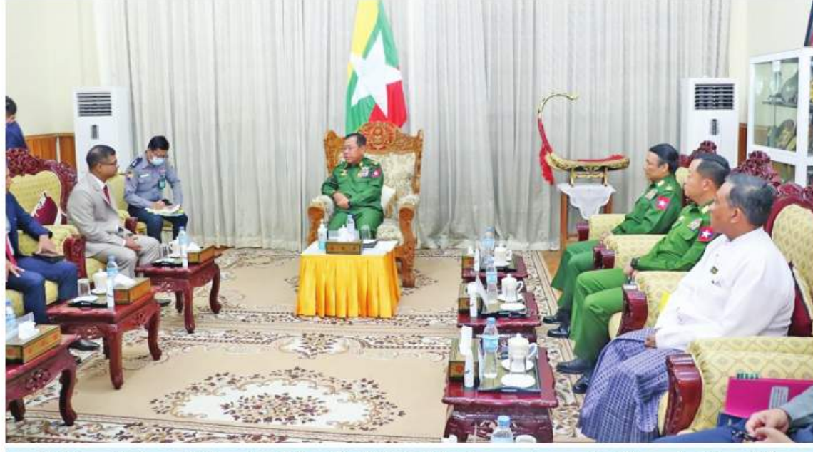
ပြည်ထဲရေးဝန်ကြီးဌာန ပြည်ထောင်စုဝန်ကြီး ဒုတိယဗိုလ်ချုပ်ကြီးစိုးထွဋ်အား ဘင်္ဂလားဒေ့ရှ်နယ်ခြားစောင့်တပ်ဖွဲ့ ညွှန်ကြားရေးမှူးချုပ် ဗိုလ်ချုပ် Shakil Ahmed (SPP, nswc, afwc, psc) နှင့် ကိုယ်စားလှယ်အဖွဲ့က လာရောက်ဂါရဝပြုတွေ့ဆုံစဉ်။

နေပြည်တော် နိုဝင်ဘာ ၂၅ နိုင်ငံတော် စီမံအုပ်ချုပ်ရေးကောင်စီ အဖွဲ့ဝင် ပြည်ထဲရေးဝန်ကြီးဌာန ပြည်ထောင်စုဝန်ကြီး ဒုတိယဗိုလ်ချုပ်ကြီး စိုးထွဋ်အား ဘင်္ဂလားဒေ့ရှ်ပြည်သူ့သမ္မတနိုင်ငံ နယ်ခြားစောင့်တပ်ဖွဲ့များ၏ ညွှန်ကြားရေးမှူးချုပ် ဗိုလ်ချုပ် Shakil Ahmed (SPP, nswc, afwc, psc) နှင့် အဆင့်မြင့်အရာရှိကြီးများက ယနေ့ နံနက် ၁၀ နာရီခွဲတွင် ပြည်ထဲရေးဝန်ကြီးဌာန ပြည်ထောင်စုဝန်ကြီး၏ ညွှန်ကြားရေးမှူးချုပ် လာရောက်ဂါရဝပြု တွေ့ဆုံသည်။ ထိုသို့တွေ့ဆုံရာတွင် ပြည်ထောင်စုဝန်ကြီးနှင့်အတူ ဒုတိယဝန်ကြီး ဗိုလ်ချုပ်စိုးတင်နိုင်၊ ဒုတိယဝန်ကြီး ချစ်ဝင်း၊ ဒုတိယဗိုလ်ချုပ်ကြီး ဦးခိုင်ထွန်းနှင့် မြန်မာနိုင်ငံရဲတပ်ဖွဲ့မှ အဆင့်မြင့်အရာရှိကြီးများ တက်ရောက်ခဲ့သည်။ တွေ့ဆုံမှုတွင် မြန်မာ-ဘင်္ဂလားဒေ့ရှ် နှစ်နိုင်ငံနယ်စပ်ဒေသလုံခြုံရေးနှင့် တရားဥပဒေစိုးမိုးရေး၊ အကြမ်းဖက်မှုတိုက်ဖျက်ရေး၊ တရားမဝင်နယ်စပ်ဖြတ်ကျော်ဝင်ရောက်နေမှုများ တားဆီးနှိမ်နင်းရေး၊ နယ်မြေသတင်းအချက်အလက်များ အချိန်နှင့်တစ်ပြေးညီဖလှယ်ခြင်းတို့နှင့် စပ်လျဉ်း၍ ဆွေးနွေးခဲ့သည်။ ဘင်္ဂလားဒေ့ရှ် နယ်ခြားစောင့်တပ်ဖွဲ့က အကြမ်းဖက်အုပ်စုနှင့် အကြမ်းဖက်သမားများအား ဘင်္ဂလားဒေ့ရှ်နယ်မြေတွင် လုံးဝအခြေပြုခိုအောင်းခွင့် ပြုမည်မဟုတ်ပါကြောင်း၊ တားဆီးနှိမ်နင်းရေးကို မြန်မာနိုင်ငံနယ်ခြားစောင့်ရဲတပ်ဖွဲ့နှင့် ပိုမိုပူးပေါင်းဆောင်ရွက်တိုက်ဖျက်သွားမည်ဖြစ်ကြောင်း ဆွေးနွေးပြောကြားခဲ့သည်။ ထို့ပြင် နယ်စပ်ဒေသတည်ငြိမ်အေးချမ်းရေးအတွက် နယ်နိမိတ်မျဉ်းတစ်လျှောက် နှစ်ဖက်ညှိနှိုင်းတင်းလှည့်ခြင်း၊ ချစ်ကြည်ရင်းနှီးမှု ပိုမိုကောင်းမွန်အောင် အပြန်အလှန် နားလည်ယုံကြည်မှုများ တည်ဆောက်ခြင်း စသည်