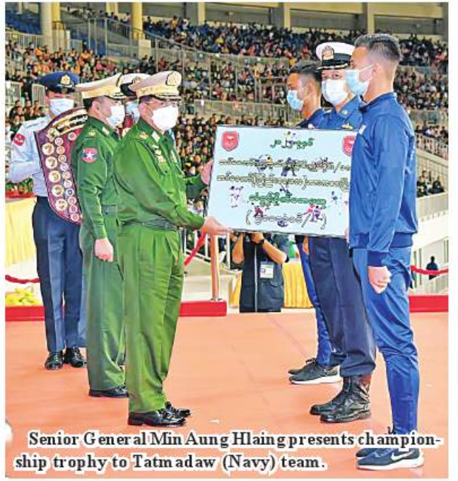
Senior General Min Aung Hlaing presents championship trophy to Tatmadaw (Navy) team.