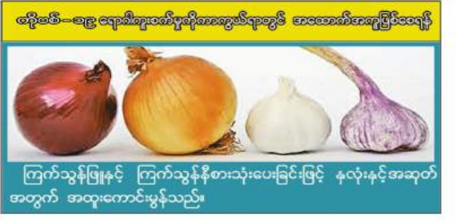
ကြက်သွန်ဖြူနှင့် ကြက်သွန်နီစားသုံးပေးခြင်းဖြင့် နှလုံးနှင့်အဆုတ် အတွက် အထူးကောင်းမွန်သည်။

စစ်ကိုင်း နိုဝင်ဘာ ၂၅ စစ်ကိုင်းတိုင်းဒေသကြီး စစ် ကိုင်းမြို့နယ်တွင် ယခုနှစ် ဆောင်း သီးနှံစိုက်ပျိုးရာသီ၌ ဂျုံ ၁၀၂၅၅ ဧက စိုက်ပျိုးပြီးစီးနေပြီဖြစ်ကြောင်း စစ်ကိုင်းမြို့နယ် စိုက်ပျိုးရေးဦးစီး ဌာနမှ သိရသည်။ ယခု ၂၀၂၂-၂၀၂၃ ခုနှစ် ဆောင်းသီးနှံ စိုက်ပျိုးရာသီ၌ စစ်ကိုင်းမြို့နယ်တွင် ဂျုံသီးနှံ ၃၁၀၃၁ ဧကစိုက်ပျိုးရန် လျာထား ပြီး ယခုနှစ် အောက်တိုဘာလမှ စတင်၍ စိုက်ပျိုးခဲ့ရာ ယနေ့ထိ ၁၀၂၅၅ ဧက စိုက်ပျိုးပြီးစီးနေပြီ ဖြစ်ကြောင်း စစ်ကိုင်းမြို့နယ် စိုက် ပျိုးရေးဦးစီးဌာနမှ သိရသည်။ “ဒီနှစ် ဆောင်းမှာ ဂျုံသီးနှံက သုံးသောင်းကျော်စိုက်ဖို့ လျာထား တယ်။ ဒီနေ့ထိ ၁၀၂၅၅ ဧက စိုက်ပြီးပြီ။ ဂျုံသီးနှံစိုက်ပျိုးမှုတော့ ကောင်းမွန်ပါတယ်။ ဂျုံသီးနှံ အထွက်တိုးဖို့ မျိုးကောင်းမျိုးသန့် တွေသုံးစွဲဖို့ ဆောင်ရွက်နေတယ်” ဂျုံသီးနှံ ၃၁၀၃၁ ဧက စိုက်ပျိုးရန် လျာထားကြောင်း စစ်ကိုင်းမြို့နယ် စိုက်ပျိုးရေးဦးစီးဌာနမှ သိရသည်။ (၂၀၆)