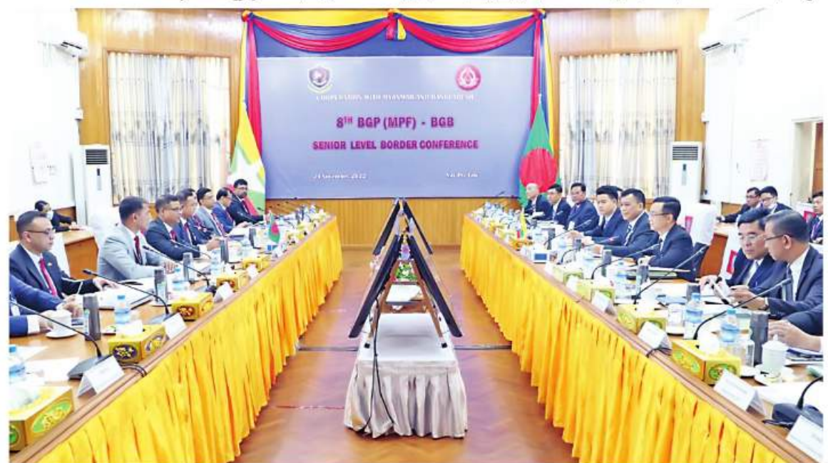
(၈)ကြိမ်မြောက် မြန်မာ-ဘင်္ဂလားဒေ့ရှ် နှစ်နိုင်ငံ နယ်ခြားစောင့်တပ်ဖွဲ့များ၏ အဆင့်မြင့်အရာရှိကြီးများအဆင့် အစည်းအဝေးကျင်းပစဉ်။

ဖြစ်ကြောင်း ဆွေးနွေးပြောကြား၍ အမှတ်တရလက်ဆောင်များ အပြန်အလှန် ပေးအပ်ခဲ့ကြသည်။ (၈)ကြိမ်မြောက် မြန်မာ-ဘင်္ဂလားဒေ့ရှ် နှစ်နိုင်ငံ နယ်ခြားစောင့်တပ်ဖွဲ့များ၏ အဆင့်မြင့်အရာရှိကြီးများအဆင့် အစည်းအဝေးတွင် မြန်မာ-ဘင်္ဂလားဒေ့ရှ် နယ်စပ်ဒေသလုံခြုံရေးနှင့် တရားဥပဒေစိုးမိုးရေးအတွက် အချိန်နှင့်တစ်ပြေးညီ သတင်းဖလှယ်မှုများ ဆောင်ရွက်ရန်၊ တပ်ရင်းများအဆင့်၊ ဒေသတွင်းကူညီမှုအဆင့်နှင့် အဆင့်မြင့်အရာရှိကြီးများအဆင့် အစည်းအဝေးတို့ကို နှစ်ဖက်သဘောတူညီထားသည့်အတိုင်း လစဉ်၊ နှစ်စဉ် ကျင်းပရန်၊ ဘင်္ဂလားဒေ့ရှ်ပိုင်နက် နယ်မြေကိုအသုံးပြု၍ အခြားနိုင်ငံအပေါ် ဆန့်ကျင်မည့် မည်သည့်အုပ်စုကိုမဆို ခွင့်ပြုသွားမည်မဟုတ်ဘဲ ရှာဖွေစုံစမ်းပိတ်ဆို့တားဆီးနှိမ်နင်းရန်၊ နယ်စပ်ဖြတ်ကျော်ရာဇဝတ်တိုက်ဖျက်ရေးကို ကြိုတင်တားဆီးကာကွယ်သွားရန်၊ အကြမ်းဖက်သမားများ၏ ခြိမ်းခြောက်မှုသည် မူးယစ်ဆေးဝါးနှင့် တရားမဝင်နယ်စပ်ဖြတ်ကျော်ခိုအောင်းမှုများ ဖြစ်ပေါ်စေသဖြင့် တားဆီးနှိမ်နင်းရေး ထိရောက်စွာ