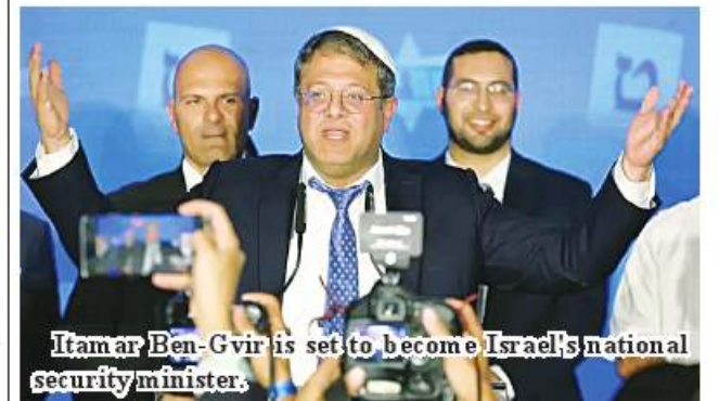
Itamar Ben-Gvir is set to become Israel's national security minister.