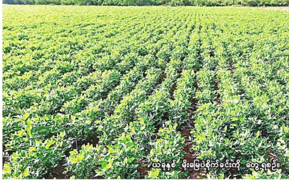
ယခုနှစ် မိုးမြေပိုစိုက်ခင်းကို တွေ့ရစဉ်။

ကို မျိုးကောင်းမျိုးသန့်များ ရွေး ချယ်စိုက်ပျိုးရေး၊ သိပ္ပံနည်းကျ စိုက်ပျိုးနည်းစနစ်များ လိုက်နာ ကျင့်သုံးရေး၊ သဘာဝမြေဩဇာ နှင့် ဓာတ်မြေဩဇာကို စနစ်တကျ သုံးစွဲရေးနှင့် ပိုးမွှားကျရောက်မှု ကာကွယ်ရေး နည်းလမ်းများကို သင်ကြားပို့ချပြီး နေကြာသီးနှံ စိုက်ပျိုးရေးအသိပညာပေး လက် ကမ်းစာစောင်များ ဖြန့်ဝေပေးခဲ့ ကြောင်း သိရသည်။ (၂၀၆)