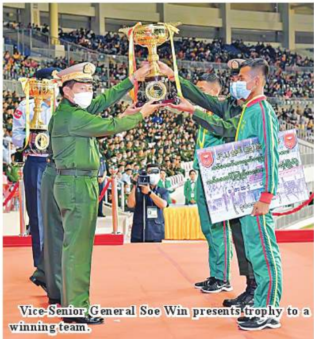
Vice-Senior General Soe Win presents trophy to a winning team.

While they were leaving the ground, fireworks were set off to mark the successful conclusion of the football match and sports meet. 100