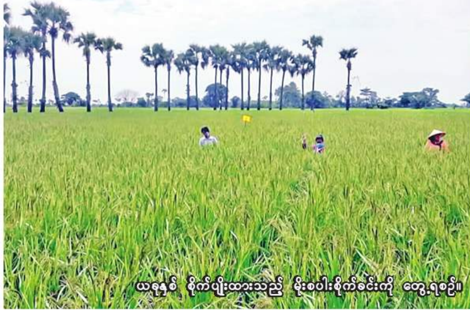
ယခုနှစ် စိုက်ပျိုးထားသည့် စပါးစိုက်ခင်းကို တွေ့ရစဉ်။

ဝက်လက် နိုဝင်ဘာ ၂၂ စစ်ကိုင်းတိုင်းဒေသကြီး ရွှေဘိုခရိုင် ဝက်လက်မြို့နယ်၌ ၂၀၂၂-၂၀၂၃ ခုနှစ် နွေသီးနှံစိုက်ပျိုးရာသီတွင် နွေစပါးကေ ၃၁၇၀၀ စိုက်ပျိုးရန် လျာထားကြောင်း ဝက်လက်မြို့နယ် စိုက်ပျိုးရေးဦးစီးဌာနမှ သိရသည်။