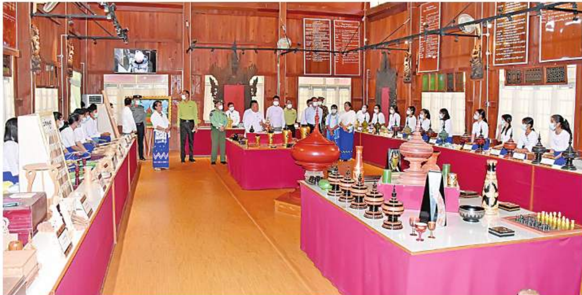
မန္တလေး နိုဝင်ဘာ ၂၂

မန္တလေးတိုင်းဒေသကြီး ဝန်ကြီးချုပ် ဦးမောင်ကိုသည် တိုင်းဒေသကြီးဝန်ကြီးများနှင့် တာဝန်ရှိသူများလိုက်ပါလျက် နိုဝင်ဘာ ၂၁ ရက်က ညောင်ဦးမြို့နယ်ရှိ ယွန်းပညာကောလိပ်(ပုဂံ)၊ မြစ်ရေတင်လုပ်ငန်းများနှင့် စိုက်ပျိုးရေးသုတေသနပြုတိုက်တို့ရှိပြီး ဒေသပွဲ ပြုစုတိုးတက်ရေးလုပ်ငန်းဆောင်ရွက်နေမှုများကို ကြည့်ရှုစစ်ဆေးသည်။