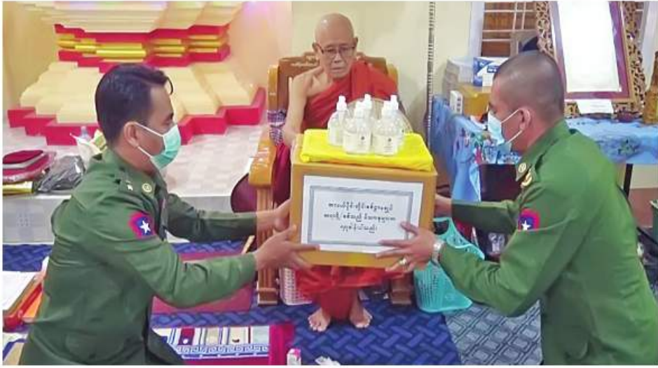
ဆရာတော်ထံ အလယ်ပိုင်းတိုင်း ဝန်ကြီးဌာနချုပ်မှ နယ်မြေစံ တပ်မတော်သားများက ကိုဗစ်-၁၉ ရောဂါ ကာကွယ်ရေး အထောက်အကူပြု ပစ္စည်းများနှင့် လှူဖွယ်ပစ္စည်းများ ဆက်ကပ်လှူဒါန်းစဉ်။

နေပြည်တော် ခိုဝင်ဘာ ၂၂ ကိုဗစ်-၁၉ ရောဂါကြိုတင်ကာကွယ်ရေး လုပ်ငန်းများ ဆောင်ရွက်နေသည့်ကာလ အတွင်း ဆွမ်းကိစ္စရပ်များ အဆင်ပြေစေ ရန်ရည်ရွယ်၍ တပ်မတော်(ကြည်း၊ ရေ၊ လေ) အရာရှိ၊ စစ်သည်၊ အရာထမ်း၊ အမှုထမ်း များနှင့် စေတနာရှင်အလှူရှင်များက မြို့နယ်အသီးသီးရှိ ဘုန်းတော်ကြီးကျောင်း များ၊ သာသနာ့ဇယပ်ဝင် သီလရှင်ကျောင်း များ၊ ဘာသာရေးကျောင်းများနှင့် ဘိုးဘွား ရိပ်သာများသို့ ဆွမ်းဆန်တော်၊ ဆီ၊ ဆား၊ ပဲ အမည်လေးမျိုးနှင့် လှူဖွယ်ပစ္စည်းများ လှူဒါန်းခြင်းနေ့ဆွမ်းများဆက်ကပ်လှူဒါန်း ခြင်းနှင့် လိုအပ်သည့် ကျန်းမာရေးစစ်ဆေး ကုသပေးခြင်းများကို ဆောင်ရွက်လျက် ရှိသည်။ ထိုသို့ဆောင်ရွက်လျက်ရှိရာ ယနေ့တွင် ကချင်ပြည်နယ် မိုးညှင်းမြို့ရှိ ထီးလင်း ဘုန်းတော်ကြီးကျောင်းတိုက်၊ ရှမ်းပြည်နယ် (မြောက်ပိုင်း) ကွတ်ခိုင်မြို့ရှိ တောင်တန်း ဒေသ ထေရဝါဒပုဂ္ဂိုလ်သောသနာပြုကျောင်း