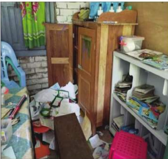
တောင်ငူမြို့နယ်၌ PDF အမည်ခံ အကြမ်းဖက်သမားများက အခြေခံပညာမူလတန်းကျောင်းရှိ ကျောင်းသုံးပစ္စည်းများ ဝင်ရောက်ဖျက်ဆီးမှုကို တွေ့ရစဉ်။

နေပြည်တော် နိုဝင်ဘာ ၂၂ နိုင်ငံတော်အစိုးရအနေဖြင့် နိုင်ငံ၏ အနာဂတ်ဖြစ်သည့် မျိုးဆက်သစ် ရင်သွေး ငယ်များ၏ ပညာရေးတွင်နောက်ကျ ကျန်ရစ်မှုမဖြစ်ပေါ်စေရေးအတွက် ပညာ သင်ကြားနိုင်မှုအခွင့်အလမ်းကို ပြည့်ဝစွာ အသုံးပြုနိုင်စေရန် အခြေခံပညာကျောင်း များကို ဇွန် ၂ ရက်တွင် စတင်ဖွင့်လှစ် သင်ကြားပေးခဲ့ပြီး ကျောင်းဝတ်စုံကျောင်း သုံးဖတ်စာအုပ်အပါအဝင် ကျောင်းသုံး စာရေးကိရိယာများကို နိုင်ငံတော်အစိုးရက