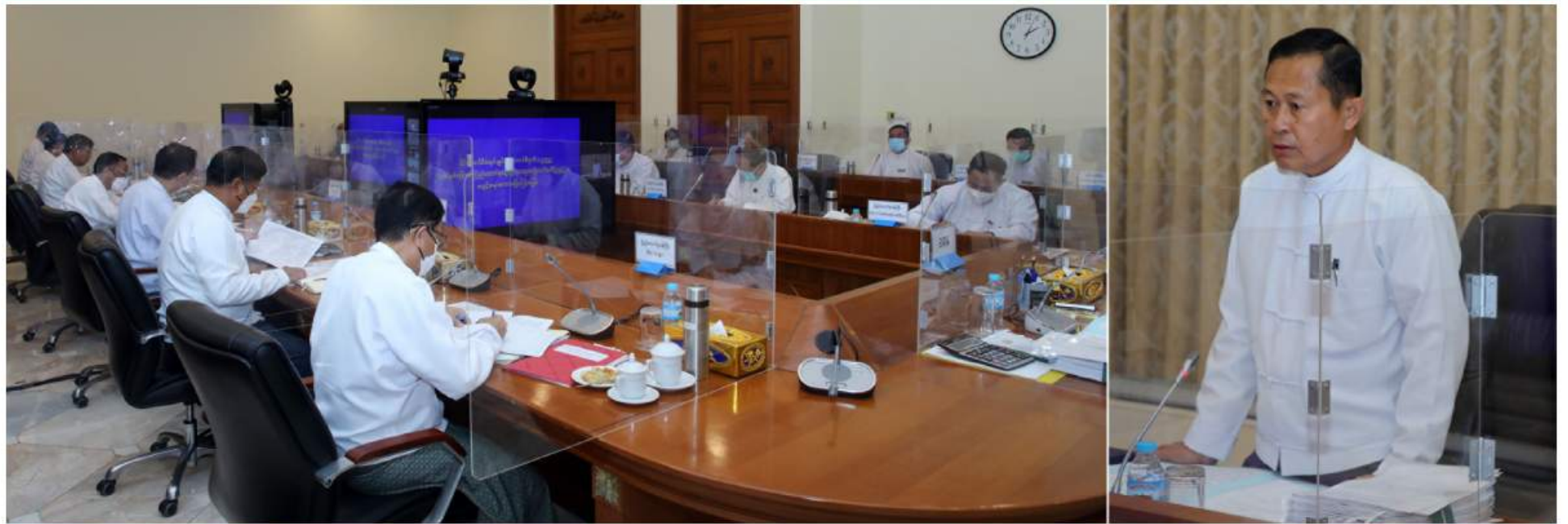
၂၀၂၃ ခုနှစ် (၇၆)နှစ်မြောက် ပြည်ထောင်စုနေ့ကျင်းပရေးပဟိုက်မတ်ီဥက္ကဋ္ဌ နိုင်ငံတော်စီမံအုပ်ချုပ်ရေးကောင်စီဒုတိယဥက္ကဋ္ဌ ဒုတိယဝန်ကြီးချုပ် ဒုတိယဗိုလ်ချုပ်မှူးကြီးစိုးဝင်း ၂၀၂၃ ခုနှစ် (၇၆)နှစ်မြောက် ပြည်ထောင်စုနေ့ကျင်းပရေးပဟိုက်မတ်ီ ပထမအကြိမ် ညှိနှိုင်းအစည်းအဝေးတွင် အမှာစကားပြောကြားစဉ်။

နေပြည်တော် နိုဝင်ဘာ ၂၂ ၂၀၂၃ ခုနှစ် (၇၆)နှစ်မြောက် ပြည်ထောင်စုနေ့ကျင်းပရေးပဟိုက်မတ်ီ ပထမအကြိမ် ညှိနှိုင်းအစည်းအဝေးကို ယနေ့မွန်းလွဲပိုင်းတွင် နေပြည်တော်ရှိ နိုင်ငံတော်စီမံအုပ်ချုပ်ရေးကောင်စီဥက္ကဋ္ဌ ရုံးအစည်းအဝေးခန်းမ၌ ကျင်းပရာ ၂၀၂၃ ခုနှစ် (၇၆)နှစ်မြောက် ပြည်ထောင်စုနေ့ကျင်းပရေးပဟိုက်မတ်ီဥက္ကဋ္ဌ နိုင်ငံတော်စီမံအုပ်ချုပ်ရေးကောင်စီဒုတိယဥက္ကဋ္ဌ ဒုတိယဝန်ကြီးချုပ် ဒုတိယဗိုလ်ချုပ်မှူးကြီးစိုးဝင်း တက်ရောက်အမှာစကားပြောကြားသည်။ အစည်းအဝေးသို့ ပဟိုက်မတ်ီဝင် ပြည်ထောင်စုဝန်ကြီးများ၊ စီမံခန့်ခွဲမှုကော်မတီဥက္ကဋ္ဌ၊ ဆပ်ကော်မတီဥက္ကဋ္ဌများဖြစ်ကြသည့် ဒုတိယဝန်ကြီးများနှင့် တာဝန်ရှိသူများတက်ရောက်ကြပြီး ကျန်ကော်မတီဝင်များက ဝီဒီယိုကွန်ဖရင့်စနစ်ဖြင့် တက်ရောက်ကြသည်။ အစည်းအဝေးတွင် ၂၀၂၃ ခုနှစ် (၇၆)နှစ်မြောက် ပြည်ထောင်စုနေ့ကျင်းပရေးပဟိုက်မတ်ီဥက္ကဋ္ဌ နိုင်ငံတော်စီမံအုပ်ချုပ်ရေးကောင်စီ ဒုတိယဥက္ကဋ္ဌ ဒုတိယဝန်ကြီးချုပ် ဒုတိယဗိုလ်ချုပ်မှူးကြီးစိုးဝင်းက အမှာစကားပြောကြားရာတွင် (၇၆)နှစ်မြောက် ပြည်ထောင်စုနေ့အခမ်းအနားကို အောင်မြင်စွာကျင်းပပြုလုပ်နိုင်ရေးလိုအပ်သည်များကြိုတင် ညှိနှိုင်းဆောင်ရွက်နိုင်ရန် ပြုလုပ်သည့် ပထမအကြိမ် ညှိနှိုင်းအစည်းအဝေးဖြစ်ကြောင်း၊ (၇၅)နှစ်မြောက် စိန်ရတုလွတ်လပ်ရေးနေ့အခမ်းအနားကို ဇန်နဝါရီလတွင် ကျင်းပပြုလုပ်မည်ဖြစ်ပြီး (၇၆)နှစ်မြောက် ပြည်ထောင်စုနေ့အခမ်းအနားကို တစ်ဆက်စပ်တည်း ဆက်လက်ပြုလုပ်သွားမည်ဖြစ်သဖြင့် အခမ်းအနားများဆက်နေသည်ကို