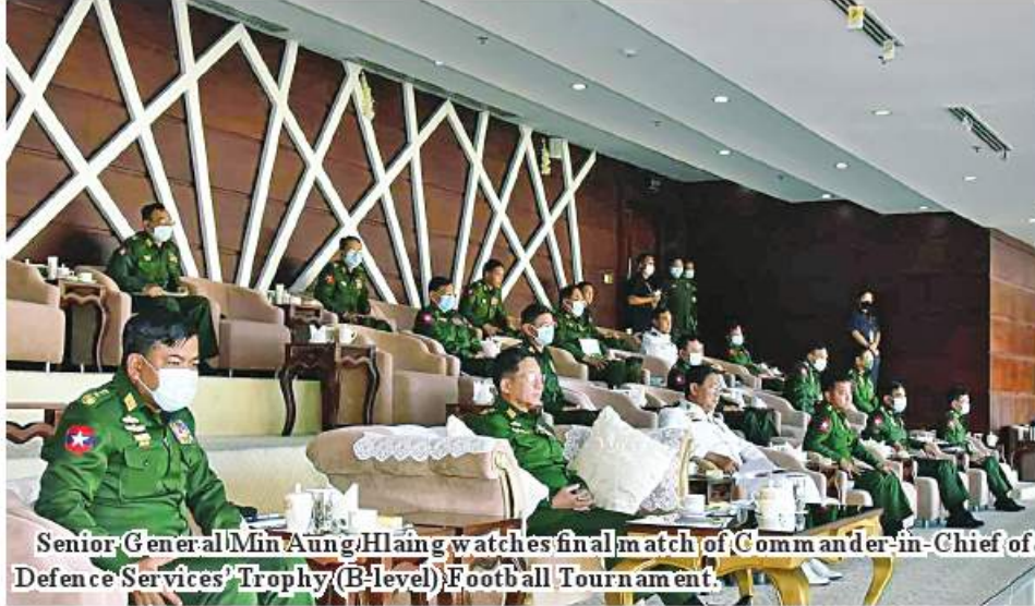
Senior General Min Aung Hlaing watches final match of Commander-in-Chief of Defence Services' Trophy (B-level) Football Tournament.