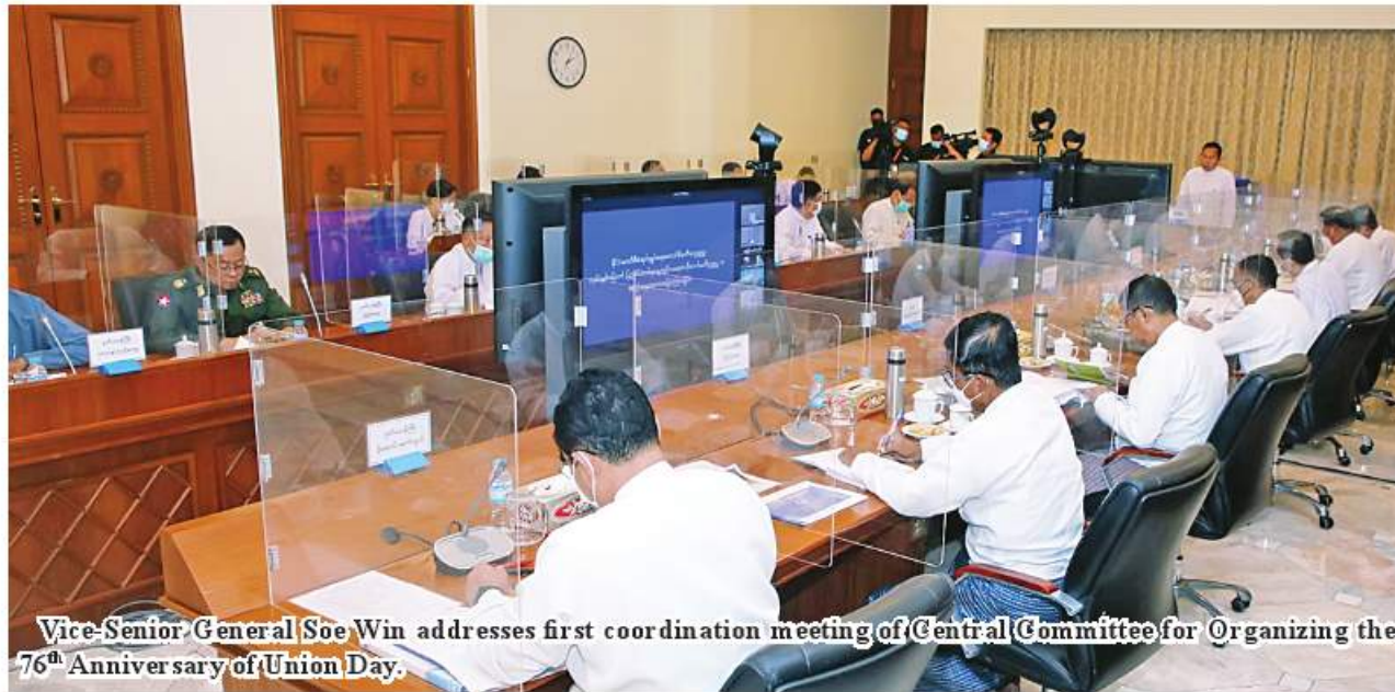
Vice-Senior General Soe Win addresses first coordination meeting of Central Committee for Organizing the 76 th Anniversary of Union Day.