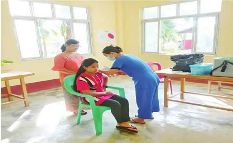
ရောဂါတိုင်းဒေသကြီး ပုသိမ်မြို့ရှိ ဒေသခံပြည်သူများကို ကိုဗစ်-၁၉ ရောဂါ ကာကွယ်ဆေးထိုးနှံပေးစဉ်။

နေပြည်တော် ခိုဝင်ဘာ ၂၂ ကိုဗစ်-၁၉ ရောဂါ ကာကွယ် ထိန်းချုပ်၊ ကုသရေးဆောင်ရွက်ရာတွင် ကာကွယ်ဆေး ထိုးနှံခြင်းသည် အဓိကအခန်းကဏ္ဍတွင် ပါဝင်သည့် လုပ်ငန်းတစ်ရပ်ဖြစ်သောကြောင့် တိုင်းဒေသကြီးနှင့် ပြည်နယ်အသီးသီးတို့၌ ကာကွယ်ဆေးထိုးနှံခြင်းကို အင်တိုက် အားတိုက်ဆောင်ရွက်လျက်ရှိရာ ယနေ့ တွင် ရန်ကုန်တိုင်းဒေသကြီး သာကေတ မြို့နယ်၌ ဒေသခံပြည်သူဦးရေ ၁၁၀၊ ဧရာဝတီတိုင်းဒေသကြီးအတွင်းရှိ မြို့နယ် ၂၆ မြို့နယ်တို့၌ ဒေသခံပြည်သူဦးရေ