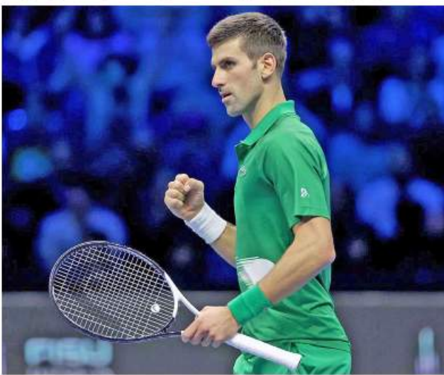
Tie-break ထိ ကစားခဲ့ရပြီးမှ ရှုံးနိမ့်ခဲ့ရတယ်။ တတိယပွဲငယ်မှာလဲ Tie-break ထိ ကစားခဲ့ရတယ်။ ရလဒ်ပိုင်းနယ်အဆင့်မှာ အကောင်းဆုံးကို ကြည့်ခြင်းအားဖြင့် ကျွန်တော့်အနေနဲ့ သက်လုံပိုင်းအားနည်းနေ

ဂျီကိုဗစ်သည် မျက်နှာပျက်ကို ပထမပွဲငယ်တွင် အနိုင်ရရှိခဲ့ပြီး ဒုတိယပွဲငယ်တွင် သက်လုံပိုင်းသိသိသာသာကျဆင်း၍ ရှုံးနိမ့်ခဲ့ရသော်လည်း တတိယပွဲငယ်တွင် မျက်နှာပျက်က အမှားများခဲ့ခြင်းကြောင့်သာ ဂျီကိုဗစ်အနိုင်ရခဲ့ခြင်းဖြစ်သည်။ ဂျီကိုဗစ်က “ပထမပွဲငယ်မှာ အကောင်းဆုံးပုံစံနဲ့ ကစားနိုင်ခဲ့တယ်။ ဒုတိယပွဲငယ်မှာတော့ အမှားများခဲ့သလို သက်လုံပိုင်းက စကားပြောလာတယ်။ မျက်နှာပျက်က စားသွားတာ အရမ်းကောင်းပါတယ်။ ကျွန်တော့်အနေနဲ့ ကြိုခိုင်းမှုပိုင်းက အားနည်းချက်တွေရှိနေတယ်လို့ခံစားရတယ်။ ထင်ထားတာထက်ပိုပြီး မောဟိုက်လာတယ်လို့လဲခံစားရတယ်။ ဒုတိယပွဲငယ်မှာ