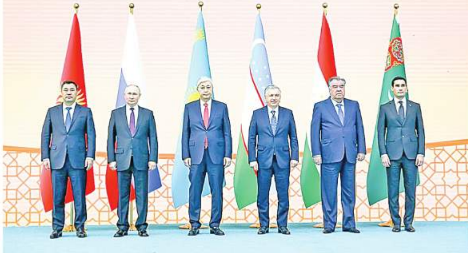
ရုရှား-အလယ်အာရှခေါင်းဆောင်များ ထိပ်သီးအစည်းအဝေး၊ ကာဂျစ်စတန်နိုင်ငံတွင် ကျင်းပစဉ်။

2022 ЖЫЛҒЫ 14 ҚАЗАН, АСТАНА САММИТ «ЦЕНТРАЛЬНАЯ АЗИЯ – РОССИЯ» АСТАНА, 14 ОКТЯБРЯ 2022 ГОДА