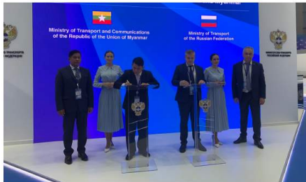
ပြည်ထောင်စုဝန်ကြီးရုံး ဖွဲ့စည်းပုံအခြေခံဥပဒေကို ရုရှားနှင့် ဝန်ကြီးဌာနမှ တာဝန်ရှိသူများက ရန်ကင်းမြို့တွင် ဖွဲ့စည်းပုံအခြေခံဥပဒေကို လက်မှတ်ရေးထိုးခဲ့ခြင်းကို ဖော်ပြသည့် ဖော်ပြချက်များကို ဖော်ပြထားသည်။

ရန်ကင်းမြို့တွင် ဖွဲ့စည်းပုံအခြေခံဥပဒေကို လက်မှတ်ရေးထိုးခဲ့ခြင်းကို ဖော်ပြသည့် ဖော်ပြချက်များကို ဖော်ပြထားသည်။ ဖွဲ့စည်းပုံအခြေခံဥပဒေကို လက်မှတ်ရေးထိုးခဲ့ခြင်းကို ဖော်ပြသည့် ဖော်ပြချက်များကို ဖော်ပြထားသည်။