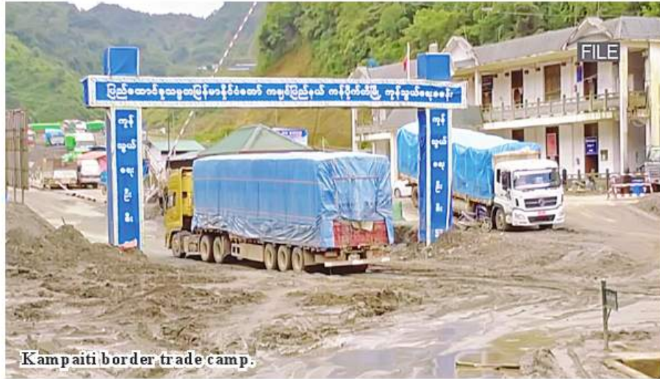
Kampaiti border trade camp.

Myitkyina November 19 Border trade amount of Kampaiti and Lweje border trade stations in Kachin State reached US$ 3.192 million during the period from No-