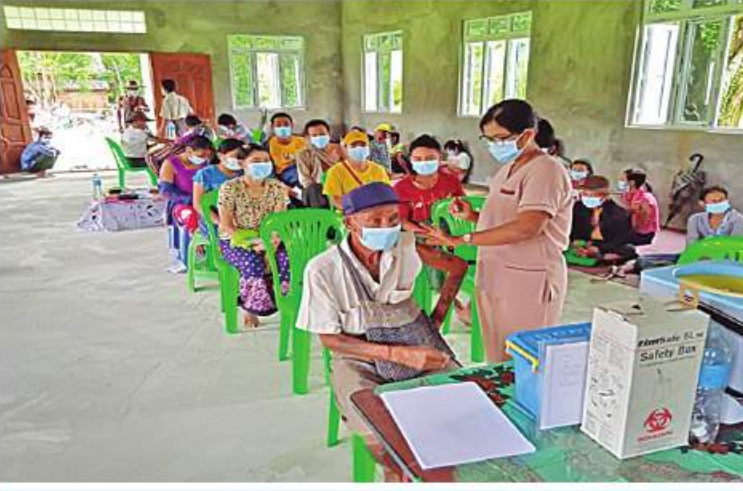
ရောဂါတိုင်းဒေသကြီး ကန့်ကြားထောင့်မြို့နယ်အတွင်းရှိ ဒေသခံပြည်သူများကို ကိုပစ်-၁၉ ရောဂါ ကာကွယ်ဆေးများ ထိုးနှံပေးစဉ်။

နေပြည်တော် ခိုဝင်ဘာ ၁၉ ကိုပစ်-၁၉ ရောဂါ ကာကွယ် ထိန်းချုပ်ကုသရေးဆောင်ရွက်ရာတွင် ကာကွယ်ဆေး ထိုးနှံခြင်းသည် အဓိကအခန်းကဏ္ဍတွင် ပါဝင်သည် လုပ်ငန်းတစ်ရပ်ဖြစ်သောကြောင့် တိုင်းဒေသကြီးနှင့် ပြည်နယ်အသီးသီးတို့၌ ကာကွယ်ဆေးထိုးနှံခြင်းကို အင်တိုက်အားတိုက်ဆောင်ရွက်လျက်ရှိရာ ယနေ့တွင် ရောဂါတိုင်းဒေသကြီးအတွင်းရှိ မြို့နယ် ၂၆ မြို့နယ်တို့၌ ဒေသခံပြည်သူ ၃၉၉၂ ဦး၊ မန္တလေးတိုင်းဒေသကြီးအတွင်းရှိ ဒေသခံပြည်သူ ၁၂၆၄ ဦးတို့ကို တပ်မတော်မှ ဆေးအဖွဲ့များက ပြည်သူ့ဆေးရုံများမှ ဆရာဝန်များ၊ သက်ဆိုင်ရာ ကျန်းမာရေးဝန်ထမ်းများ၊ စေတနာ့ဝန်ထမ်းများနှင့် ပူးပေါင်း၍ ကိုပစ်-၁၉ ရောဂါ ကာကွယ်ဆေးထိုးနှံပေးခြင်းများ ဆောင်ရွက်ပေးသည်။