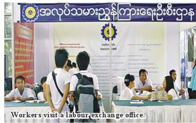
Workers visit a labour exchange office.

Hence, the ministry opens 17 labour exchange