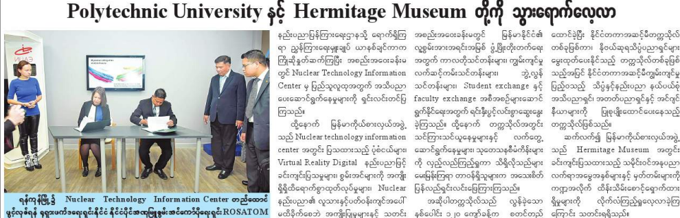
ရုရှားရှိ Nuclear Technology Information Center တည်ထောင်ဖွဲ့စည်းပုံအခြေခံဥပဒေကို ရုရှားနှင့် ဝန်ကြီးဌာနမှ တာဝန်ရှိသူများက ရန်ကင်းမြို့တွင် ဖွဲ့စည်းပုံအခြေခံဥပဒေကို လက်မှတ်ရေးထိုးခဲ့ခြင်းကို ဖော်ပြသည့် ဖော်ပြချက်များကို ဖော်ပြထားသည်။

ရုရှားနိုင်ငံတွင် အထွေထွေအားဖြင့် နှစ်နိုင်ငံအကြားပူးပေါင်းဖွဲ့စည်းဖွဲ့စည်းခဲ့ခြင်းကို ဖော်ပြသည့် ဖော်ပြချက်များကို ဖော်ပြထားသည်။ နှစ်နိုင်ငံအကြားပူးပေါင်းဖွဲ့စည်းဖွဲ့စည်းခဲ့ခြင်းကို ဖော်ပြသည့် ဖော်ပြချက်များကို ဖော်ပြထားသည်။