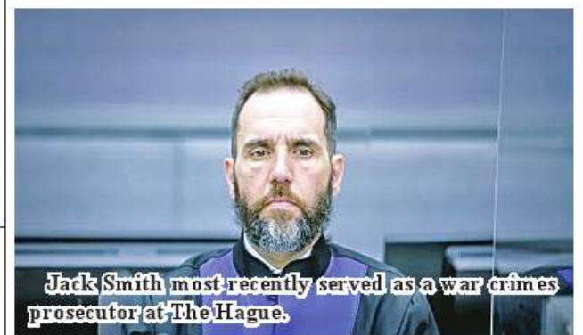
Jack Smith most recently served as a war crimes prosecutor at The Hague.

Washington November 19 Mr Smith will ultimately decide whether the former Republican president, who announced his 2024 candidacy just three days ago, will face criminal charges.