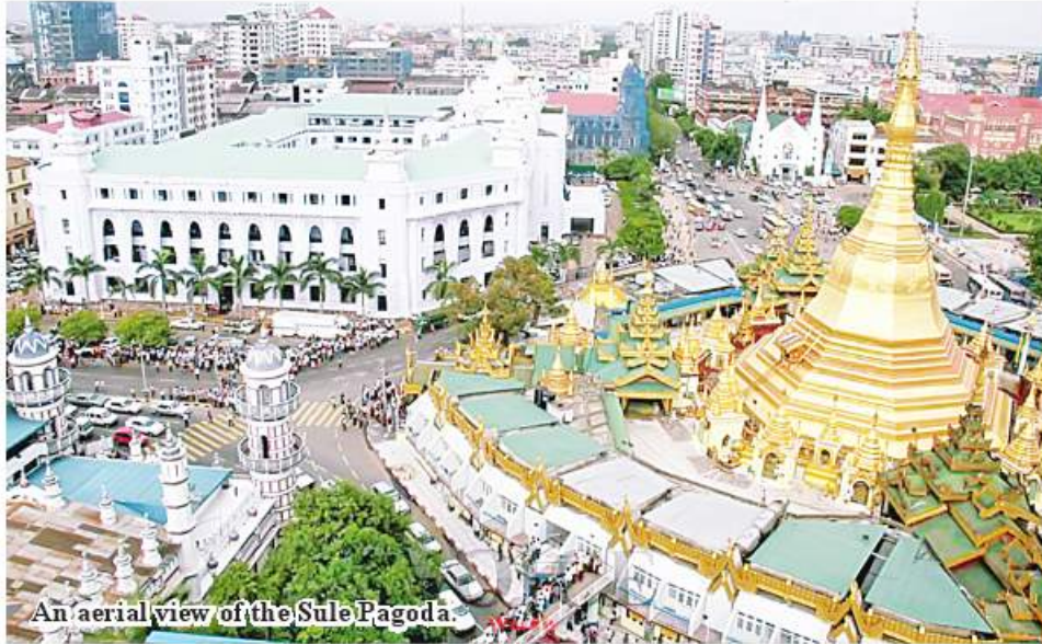
An aerial view of the Sule Pagoda.

Yangon November 19 Gold plates and gold foils will be offered to the whole structure of Sule Pagoda, according to a press release issued by the pagoda board of trustees on 18 November 2022. Gold plate and gold foil offering will be held at the umbrella, the whole structure and encircled pagodas will start in November 2022 and complete in coming April.