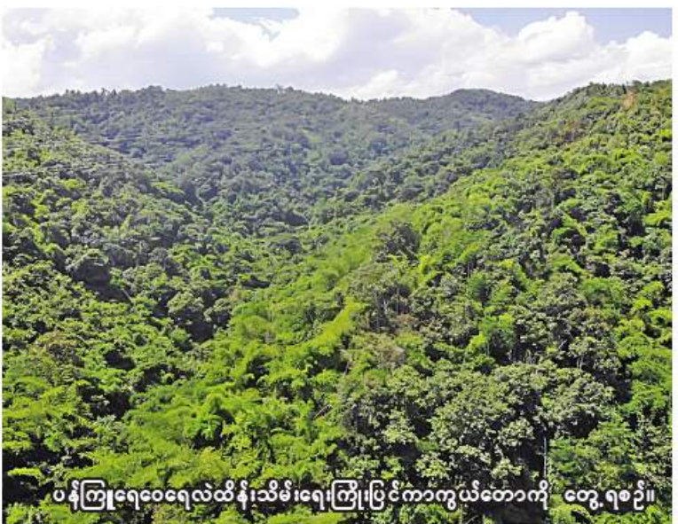
ပန်ကြူရေဝေရေလဲထိန်းသိမ်းရေးကြိုးပြင်ကာကွယ်တောကို တွေ့ရစဉ်။

နေပြည်တော် နိုဝင်ဘာ ၁၉ ပြည်ထောင်စုသမ္မတမြန်မာနိုင်ငံတော်အစိုးရ သယံဇာတနှင့် သဘာဝပတ်ဝန်းကျင်ထိန်းသိမ်းရေးဝန်ကြီးဌာနသည် ၂၀၁၈ ခုနှစ်တွင် ပြဋ္ဌာန်းထားသည့် သစ်တောဥပဒေပုဒ်မ(၆)၊ ပုဒ်မခွဲ(င)အရ အပ်နှင်းထားသော အခွင့်အာဏာများကိုကျင့်သုံး၍ ရှမ်းပြည်နယ်(အရှေ့ပိုင်း) ကျိုင်းတုံခရိုင် ကျိုင်းတုံမြို့နယ်အတွင်းကျရောက်နေသည့် ရေယာအကျယ်အဝန်း ကေ ၁၈၂၀ ရှိသောနယ်မြေကို “ပန်ကြူရေဝေရေလဲထိန်းသိမ်းရေးကြိုးပြင်ကာကွယ်တော”အဖြစ် အမိန့်ကြော်ငြာစာအမှတ်(၁၆၃/၂၀၂၂)အရ ၁၃၈၄ ခုနှစ် တန်ဆောင်မုန်းလပြည့်ကျော် ၈ ရက်၊ ၂၀၂၂ ခုနှစ် နိုဝင်ဘာ ၁၅ ရက်မှစ၍ သတ်မှတ်သည်ဟု ကြေညာလိုက်ကြောင်း သိရသည်။ ပန်ကြူရေဝေရေလဲထိန်းသိမ်းရေးကြိုးပြင်ကာကွယ်တောရေယာကို ကျိုင်းတုံမြို့ရေပေးဝေရေးဆောင်ရွက်ရာတွင် သန့်ရှင်းသောသောက်သုံးရေနှင့် စိုက်ပျိုးမြေများအတွက် လိုအပ်သောရေကို အဓိကထောက်ပံ့ပေးနေသည့် နှစ်ခင်ချောင်းရေဝေရေလဲဒေသ၏ ရေ မြေ ထိန်းသိမ်းကာကွယ်ရန်၊ ရာသီဥတုညီညွတ်မှုတစေရန်၊ မြေဆီမြေသားကောင်းမွန်လာစေရန်။ စာမျက်နှာ ၁၈ ကော်လံ ၁ ❖