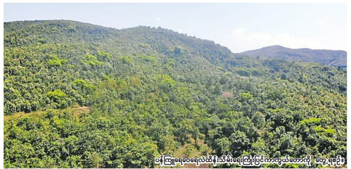
ပန်ကြားရေဝေရေလဲထိန်းသိမ်းရေးကြိုးပြင်ကာကွယ်တောကို တွေ့ရစဉ်။

သစ်ပျိုးများဖြစ်သည့် ပရုတ်၊ လောက်ယား၊ စွယ်တော်၊ သစ်ချ၊ သစ်အယ်၊ နဘဲ၊ ရေနံပင်များပေါများစွာ ပေါက်ရောက်လာ နိုင်ခြင်း၊ တောဝက်၊ ချေ၊ ဒေါင်း၊ တောကြက်၊ တောကြောင်၊ မျောက် စသည့်တိရစ္ဆာန်များ ၏ နေထိုင်ကျက်စားရာဒေသ တိုးပွားလာ နိုင်ခြင်းနှင့် မဲခေါင်မြစ်အတွင်း စီးဝင်သည့် နမ့်လွေချောင်း ရေဝေရေလဲဧရိယာအား ထိန်းသိမ်းနိုင်မည်ဖြစ်ခြင်းစသည့် အကျိုး ကျေးဇူးများ ရရှိနိုင်မည်ဖြစ်ကြောင်း သယံဇာတနှင့် သဘာဝပတ်ဝန်းကျင်ထိန်း သိမ်းရေးဝန်ကြီးဌာနမှ ထုတ်ပြန်ထား ကြောင်း သတင်းရရှိသည်။ (သတင်းစဉ်)