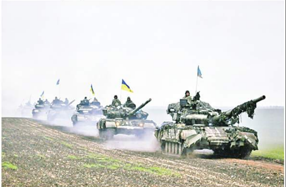
ရုရှားတပ်ဖွဲ့ဝင်များ ယူကရိန်းနယ်စပ်သို့ ချီတက်နေသည်ကို တွေ့ရစဉ်။

ထို့ကြောင့် အပြုသဘောဆောင်သော အကျိုး ကျေးဇူး အနည်းငယ်သာရှိသော်လည်း စစ်ပွဲ၏အနိ ဋ္ဌာရုံသည် ဒေသတွင်းစီးပွားရေးလုပ်ငန်းများအပေါ် ဝန်ထုပ်ဝန်ပိုးများသာ ဖြစ်ပေါ်စေလျက်ရှိသည်။ စစ်ပွဲနှင့်စီးပွားရေးဆိုင်ရာပြဿနာများသည် အလယ် အာရှနိုင်ငံများရှိ ပြည်သူများ၏ စီးပွားရေးဆိုင်ရာ စိုးရိမ်ပူပန်မှုများအပေါ် တစ်ချိန်တည်းတစ်ပြိုင်တည်း ဆိုးကျိုးသက်ရောက်လျက်ရှိသည်။ စွမ်းအင်ထုတ်ကုန် ပစ္စည်းများ ဈေးနှုန်းမြင့်တက်လာခြင်းသည် အလယ် အာရှနိုင်ငံတချို့၌ စစ်ပွဲ၏ဆိုးကျိုးများကုစားနိုင်ရေး