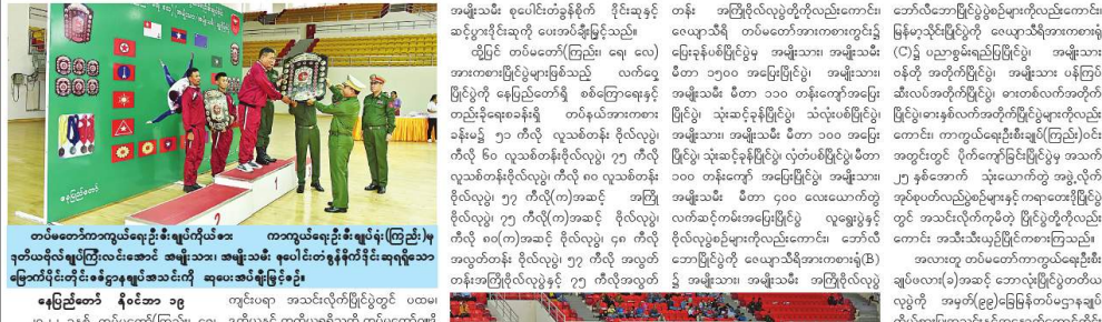
တပ်မတော်(ကြည်း) ရေ (လေ)အားကစားပြိုင်ပွဲများနှင့် တပ်မတော်(ကြည်း) ရေ (လေ) ဂျူဒိုအားကစားပြိုင်ပွဲ ဝိုင်းပန်းပွဲနှင့် အပေးပွဲကွင်းပ