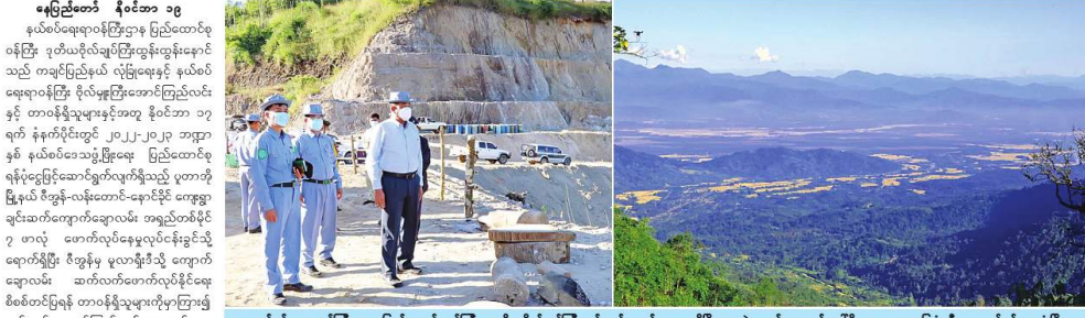
ရုရှားနိုင်ငံတွင် အထွေထွေအားဖြင့် နှစ်နိုင်ငံအကြားပူးပေါင်းဖွဲ့စည်းဖွဲ့စည်းခဲ့ခြင်းကို ဖော်ပြသည့် ဖော်ပြချက်များကို ဖော်ပြထားသည်။

ရုရှားနိုင်ငံတွင် အထွေထွေအားဖြင့် နှစ်နိုင်ငံအကြားပူးပေါင်းဖွဲ့စည်းဖွဲ့စည်းခဲ့ခြင်းကို ဖော်ပြသည့် ဖော်ပြချက်များကို ဖော်ပြထားသည်။ နှစ်နိုင်ငံအကြားပူးပေါင်းဖွဲ့စည်းဖွဲ့စည်းခဲ့ခြင်းကို ဖော်ပြသည့် ဖော်ပြချက်များကို ဖော်ပြထားသည်။