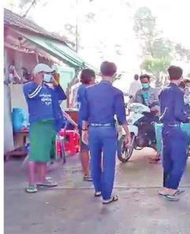
ရန်ကုန်တိုင်းဒေသကြီးအတွင်းရှိ မြို့နယ်များ၌ တာဝန်ရှိသူများက ဒေသခံပြည်သူ များကို Mask များ အခမဲ့ပေးဝေလျှော့နည်းစဉ်။

မန္တလေးတိုင်းဒေသကြီးအတွင်းရှိ ခရိုင် ကိုပစ်-၁၉ ရောဂါ ကာကွယ်ဆေးထိုးနှံ ခရိုင် ကိုပစ်-၁၉ ရောဂါ ကာကွယ်ဆေးထိုးနှံ ပေးခြင်းများ ဆောင်ရွက်ပေးသည်။ ထို့ပြင် ကိုပစ်-၁၉ ရောဂါ ထိန်းချုပ် ကာကွယ်ရာတွင် အထောက်အကူဖြစ်စေရန်အတွက် Mask များကို ပြည်သူများ လက်ဝယ်အရောက် တိုင်းစစ်ဌာနချုပ် အသီးသီးမှ တာဝန်ရှိသူများက အခမဲ့ ပေးဝေလျှော့နည်းလျက်ရှိရာ ယနေ့တွင် ရန်ကုန်တိုင်းဒေသကြီးအတွင်းရှိ မြို့နယ် ၄၄ မြို့နယ်တို့ရှိ စာသင်ကျောင်းများ၊ ဈေးများ၊ လမ်းများ၊ မြို့အဝင်ဝိတ်များနှင့် လူစည်ကားရာနေရာများတွင် နယ်မြေခံ တပ်မတော်သားများက ခရိုင်၊ မြို့နယ်စီမံ အုပ်ချုပ်ရေးအဖွဲ့မှ တာဝန်ရှိသူများ၊ ဌာန ဆိုင်ရာဝန်ထမ်းများ၊ ပရဟိတအဖွဲ့များနှင့် ပူးပေါင်း၍ ကိုပစ်-၁၉ ရောဂါ ကာကွယ်ရေး အတွက် အသိပညာပေးဆောင်ရွက်ခြင်း၊ Mask များ တပ်ဆင်ပြီးသွားလာကြရန် လှုံ့ဆော်ခြင်းနှင့် Mask များကို ဒေသခံ ပြည်သူများ လက်ဝယ်အရောက် အခမဲ့ပေး ဝေလျှော့နည်းခဲ့ကြောင်း သတင်းရရှိသည်။