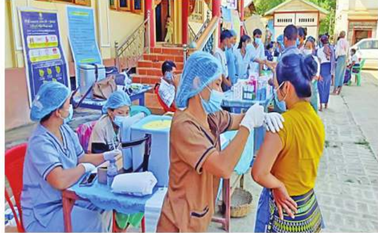
မန္တလေးတိုင်းဒေသကြီး ရမည်းသင်းမြို့နယ်အတွင်းရှိ ဒေသခံပြည်သူများကို ကိုဗစ်-၁၉ ရောဂါ ကာကွယ်ဆေးများ ထိုးနှံပေးစဉ်။

နေပြည်တော် ခိုဝင်ဘာ ၁၈ ကိုဗစ်-၁၉ ရောဂါ ကာကွယ် ဆေးထိုးနှံခြင်းသည် အဓိကအခန်းကဏ္ဍတွင် ပါဝင်သည် လုပ်ငန်းတစ်ရပ်ဖြစ်သောကြောင့် တိုင်းဒေသကြီးနှင့် ပြည်နယ်အသီးသီးတွင် ကာကွယ်ဆေးထိုးနှံခြင်းကို အင်တိုက် အားတိုက်ဆောင်ရွက်လျက်ရှိရာ ယနေ့ တွင် ရောဂါတိုင်းဒေသကြီးအတွင်းရှိ မြို့နယ် ၂၆ မြို့နယ်တို့၌ ဒေသခံပြည်သူ ဦးစွာ ၁၂၉၀၊ မန္တလေးတိုင်းဒေသကြီးအတွင်း ရှိ ဒေသခံပြည်သူ ၂၈၂၄ ဦးနှင့် ပဲခူးတိုင်း ဒေသကြီး တောင်ငူမြို့၌ ဒေသခံပြည်သူ ၂၅၅၅ ဦးတို့ကို တပ်မတော်မှဆေးအဖွဲ့များ က ပြည်သူဆေးရုံများမှ ဆရာဝန်များ၊ သက်ဆိုင်ရာ ကျန်းမာရေးဝန်ထမ်းများ၊ စေတနာ့ဝန်ထမ်းများနှင့် ပူးပေါင်း၍ ကိုဗစ်-၁၉ ရောဂါကာကွယ်ဆေးထိုးနှံပေး ခြင်းများ ဆောင်ရွက်ပေးသည်။