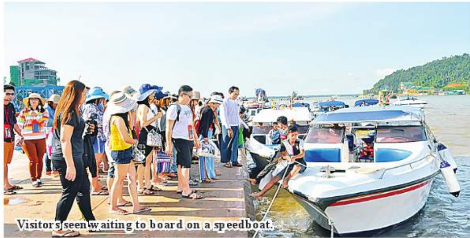
Visitors seen waiting to board on a speedboat.