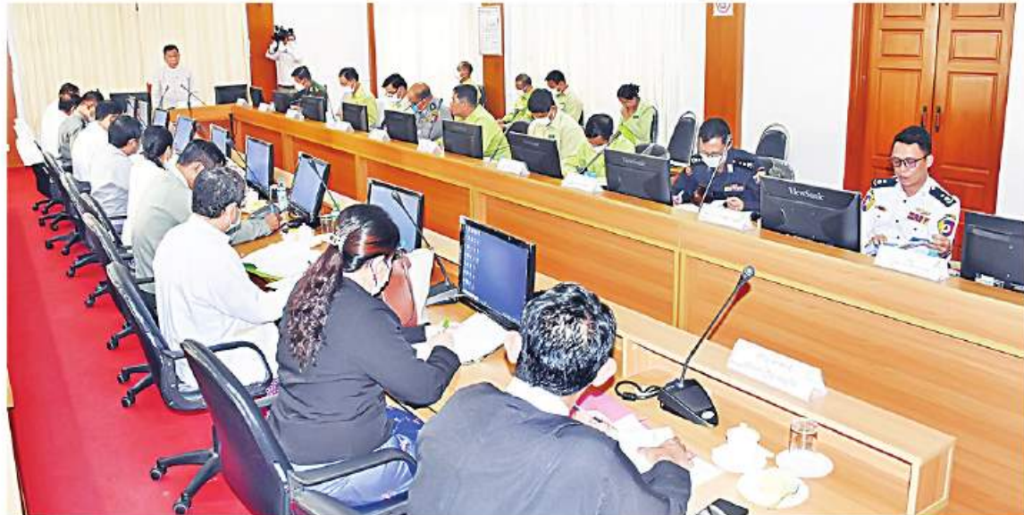
မန္တလေး နိုဝင်ဘာ ၁၈

မန္တလေးတိုင်းဒေသကြီး ယာဉ်အန္တရာယ် လမ်းအန္တရာယ် ကင်းရှင်းရေးကောင်စီ လုပ်ငန်းညှိနှိုင်းအစည်းအဝေးကို မန္တလေးတိုင်းဒေသကြီးအစိုးရအဖွဲ့ရုံး နှစ်ထပ်ဆောင်အစည်းအဝေးခန်းမတွင် ယနေ့ မွန်းလွဲပိုင်းကကျင်းပရာ တိုင်းဒေသကြီးဝန်ကြီးချုပ် ဦးမောင်ကို၊ တိုင်းဒေသကြီးဝန်ကြီးများနှင့် ဌာနဆိုင်ရာတာဝန်ရှိသူများ တက်ရောက်ကြသည်။ အစည်းအဝေး၌ တိုင်းဒေသကြီးဝန်ကြီးချုပ် ဦးမောင်ကိုက အဖွင့်အမှာစကားပြောကြားရာတွင် ပြည်သူများ ယာဉ်စည်းကမ်း၊ လမ်းစည်းကမ်း လိုက်နာစေရေး၊ ဆိုင်ကယ်စီးဦးထုပ်များ ဆောင်း