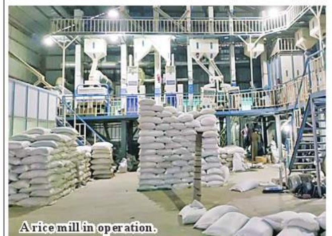
A rice mill in operation.

For further information, contact 067-3410674 of the department.