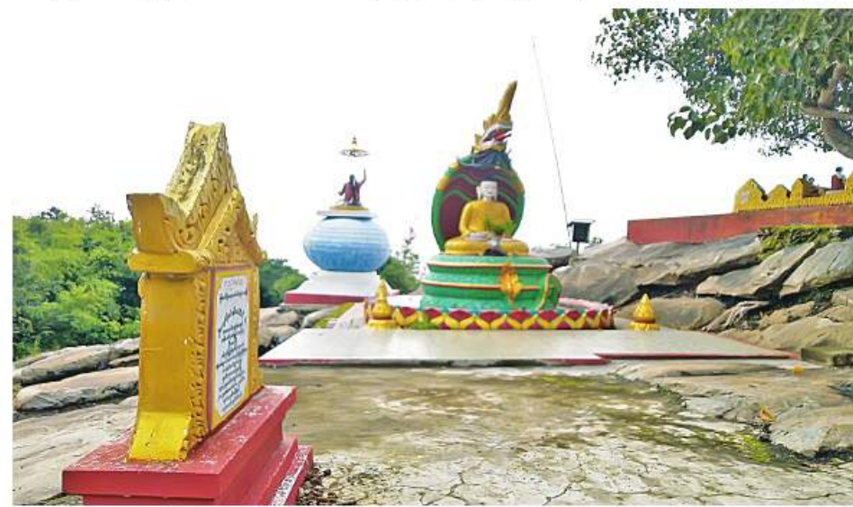
ပြက္ခဒိန်တောင်ပေါ်ရှိ နေရာတစ်နေရာကို တွေ့ရစဉ်။

ရေပဲလေးမှာနားပြီး ယောဂီအဒေါ်ကြီးနှစ်ယောက် ဧည့်ခံကျွေးမွေးတာတွေကို စားသောက်ပြီးတာနဲ့ တောင်ပေါ်မှာ စတင်လေ့လာကြရတယ်။ တောင်ထိပ် ရင်ပြင်တော်က ကျယ်ဝန်းလှတာမဟုတ်ပါဘူး။ အလယ်တည့်တည့်မှာ ဉာဏ်တော်အမြင့် ၈၁ ပေ၊ အလျား ၈၁ ပေ၊ အနံ ၈၁ ပေပတ်လည်ရှိတဲ့စေတီ တော်ကြီး တည်ရှိနေတယ်။ စေတီတော်ကြီးရဲ့