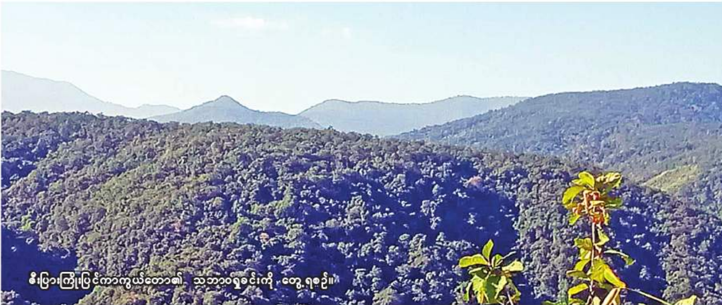
စီးပြားကြီးပြင်ကာကွယ်တော၏ သဘာဝရူပဗေဒကို တွေ့ရစဉ်။

နေပြည်တော် နိုဝင်ဘာ ၁၈ ပြည်ထောင်စုသမ္မတမြန်မာနိုင်ငံတော်အစိုးရ သယံဇာတနှင့်သဘာဝပတ်ဝန်းကျင်ထိန်းသိမ်းရေး ဝန်ကြီးဌာနသည် ၂၀၁၈ ခုနှစ်တွင် ပြဋ္ဌာန်းထား သည့် သစ်တောဥပဒေပုဒ်မ (၆)၊ ပုဒ်မခွဲ (င)အရ အပ်နှင်းထားသော အခွင့်အာဏာများကို ကျင့်သုံး ၍ မကွေးတိုင်းဒေသကြီး ဂန့်ဂေါခရိုင် ဂန့်ဂေါမြို့ နယ်အတွင်း ကျရောက်နေသည့် ဧရိယာအကျယ် အဝန်း ဧက ၂၂၀၀ ရှိသော နယ်မြေကို “စီးပြား ကြီးပြင်ကာကွယ်တော”အဖြစ် အမိန့်ကြော်ငြာ စာအမှတ် (၁၆၁/၂၀၂၂)အရ ၁၃၈၄ ခုနှစ် တန်ဆောင်မုန်းလပြည့်ကျော် ၇ ရက်၊ ၂၀၂၂ ခုနှစ် နိုဝင်ဘာ ၁၄ ရက်မှစ၍ သတ်မှတ်လိုက် သည်ဟု ကြေညာလိုက်ကြောင်း သိရသည်။ စာမျက်နှာ ၁၇ ကော်လံ ၁