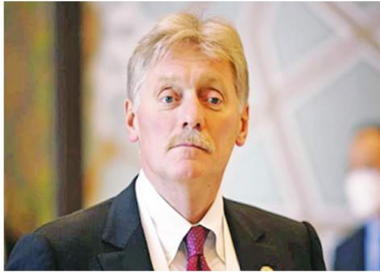
ရုရှားနိုင်ငံသည် ယူကရိန်းအထူး စစ်ဆင်ရေးကို ရာသီဥတုအခြေအနေပေါ် မူတည်ခြင်းမရှိကြောင်း၊ ဆက်လက်လုပ်ဆောင်နေပြီး ၎င်း၏ ရည်မှန်းချက်များ

အတိုင်း အောင်မြင်အောင် ဆောင်ရွက်မည်ဖြစ်ကြောင်း ရုရှားသမ္မတပြောရေးဆိုခွင့်ရှိသူ Dmitry Peskov က နိုဝင်ဘာ ၁၇ ရက်တွင် မီဒီယာများသို့ ပြောကြားခဲ့သည်။ “ယူကရိန်းအထူးစစ်ဆင်ရေးကို ဆက်လက်လုပ်ဆောင်နေပါတယ်။ ဒါဟာ ရာသီဥတုအခြေအနေပေါ်မှာ မူတည်မနေပါဘူး။ ရည်မှန်းချက်အတိုင်း အောင်မြင်အောင် ဆောင်ရွက်ရမယ်” ဟု Peskov က ပြောကြားခဲ့ကြောင်း သိရသည်။ ရာသီဥတုအပူချိန်နိမ့်ပါးသည့် အချိန်ကာလများတွင် စစ်ဆင်ရေးများကြောင့် လျှပ်စစ်နှင့်အပူပေးစနစ်မရရှိဘဲ နေထိုင်နေကြရသည့် ယူကရိန်းနိုင်ငံသား သန်းပေါင်းများစွာအတွက် ရုရှားနှင့် စေ့စပ်