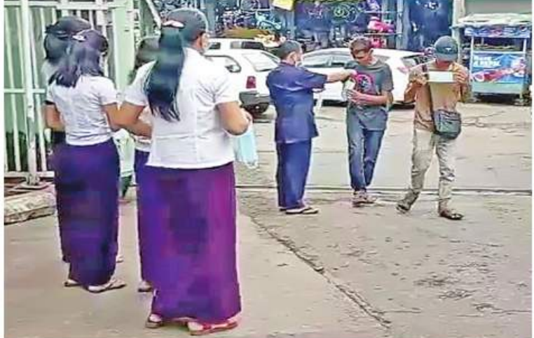
ရန်ကုန်တိုင်းဒေသကြီးအတွင်းရှိ မြို့နယ်များတွင် တာဝန်ရှိသူများက ဒေသခံ ပြည်သူများကို Mask များ အခမဲ့ပေးဝေလျှော့စားစဉ်။

များထိုးနှံပေးလျက်ရှိရာ ယနေ့တွင် စေတနာ့ဝန်ထမ်းများနှင့် ပူးပေါင်း၍ ကိုဗစ်-၁၉ ရောဂါ ကာကွယ်ဆေးထိုးနှံ ပေးခြင်းများ ဆောင်ရွက်ပေးသည်။ ထို့ပြင် ကိုဗစ်-၁၉ ရောဂါ ထိန်းချုပ် ကာကွယ်ရာတွင် အထောက်အကူဖြစ်စေ ရန်အတွက် Mask များကို ပြည်သူများ လက်ဝယ်အရောက် တိုင်းစစ်ဌာနချုပ် အသီးသီးမှ တာဝန်ရှိသူများက အခမဲ့ ပေးဝေလျှော့စားလျက်ရှိရာ ယနေ့တွင် ရန်ကုန်တိုင်းဒေသကြီးအတွင်းရှိ မြို့နယ် ၄၄ မြို့နယ်တို့ရှိ စာသင်ကျောင်းများ၊ ဈေးများ၊ လမ်းများ၊ မြို့အဝင်ဝိတ်များနှင့် လူစည်ကားရာနေရာများတွင် နယ်မြေခံ တပ်မတော်သားများက ခရိုင်၊ မြို့နယ်စီမံ အုပ်ချုပ်ရေးအဖွဲ့မှ တာဝန်ရှိသူများ၊ ဌာန ဆိုင်ရာဝန်ထမ်းများ၊ ပရဟိတအဖွဲ့များနှင့် ပူးပေါင်း၍ ကိုဗစ် -၁၉ ရောဂါ ကာကွယ်ရေး အတွက် အသိပညာပေးဆောင်ရွက်ခြင်း၊ Mask များ တပ်ဆင်ပြီးသွားလာကြရန် လှုံ့ဆော်ခြင်းနှင့် Mask များကို ဒေသခံ ပြည်သူများ လက်ဝယ်အရောက် အခမဲ့ပေး ဝေလျှော့စားခဲ့ကြကြောင်း သတင်းရရှိသည်။