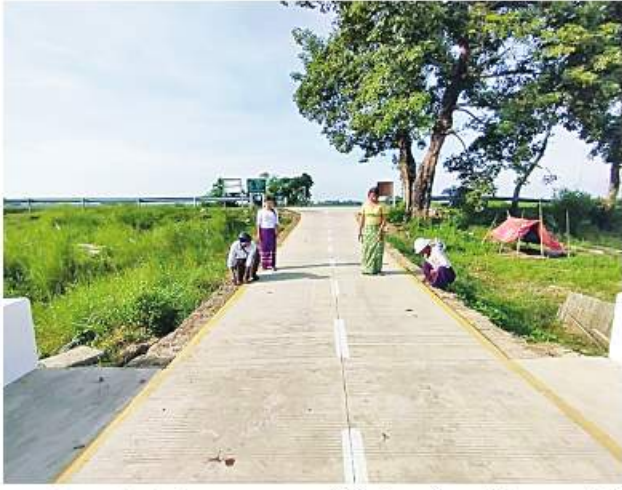
ပန်းတနော် နိုဝင်ဘာ ၁၈ ၌ ပြီးတိုးတက်ရေးဦးစီးဌာနက ပိုက်တန်းကျေးရွာအတွင်းရှိ ပန်းတန်းကျေးရွာ၌ ကုန်ထုတ်လမ်း တနော်မြို့နယ် ကျေးလက်ဒေသ ကွန်ကရစ်ခင်းခြင်းလုပ်ငန်းပြီးစီး