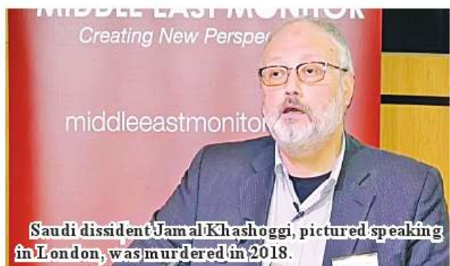
Saudi dissident Jamal Khashoggi, pictured speaking in London, was murdered in 2018.

Washington November 18 again today" with the ruling. She - along with the human rights group Democracy for the Arab World Now (Dawn), founded by Mr Khashoggi - had been seeking unspecified damages in the US from the crown prince for her fiancé's murder. The complaint accused the Saudi leader and his officials of having "kidnapped, bound, drugged and tortured, and assassinated US-resident journalist and democracy advocate Jamal Khashoggi". The secretary general of Amnesty International, Agnes Callamard, said: "Today it is immunity. It all adds up to impunity." BBC