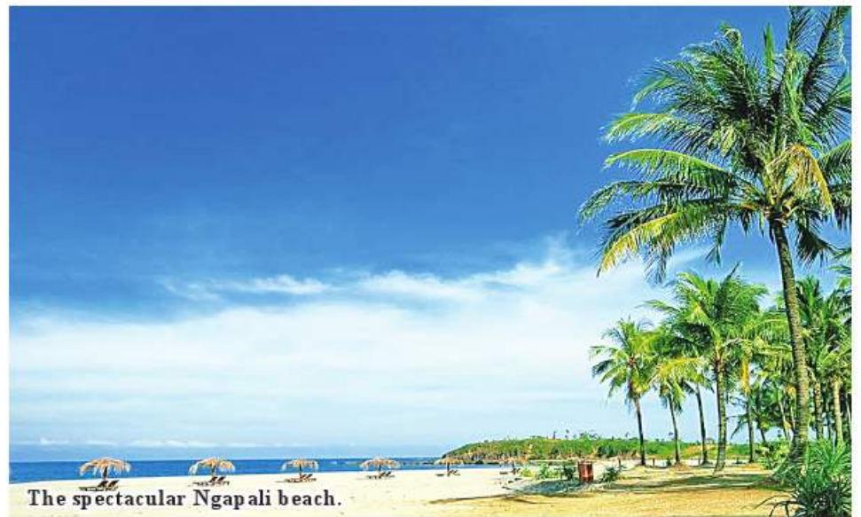
The spectacular Ngapali beach.

"This year, since Thingyan period, there has been a constant influx of tourists along the beach. Especially in months with consecutive public holidays, there is a significant increase in