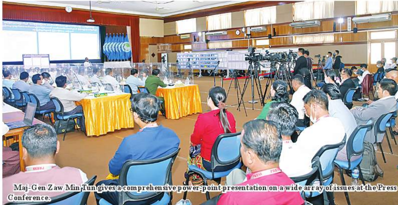
Maj-Gen Zaw Min Tun gives a comprehensive power-point presentation on a wide array of issues at the Press Conference.

Nay Pyi Taw November 18 Ministry of Information this afternoon, and Leader of the Information Team Maj-Gen Zaw Min Tun, member of the Union Election Com-