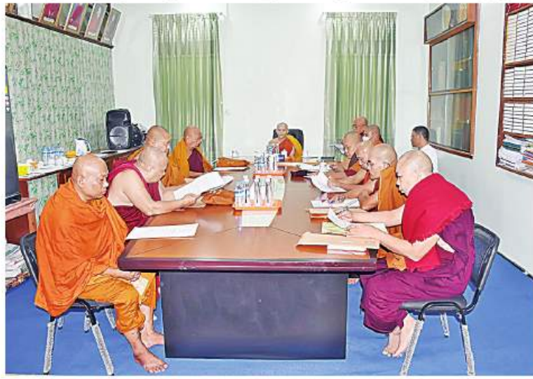
မန္တလေး နိုဝင်ဘာ ၁၈

အဋ္ဌမအကြိမ် မန္တလေးတိုင်းဒေသကြီး သံဃာ့ယကအဖွဲ့ ပဋိပက္ခပစ္စည်းအစည်းအဝေးကို မဟာအောင်မြေမြို့နယ် မစိုးရိမ်တိုက်သစ် ဓမ္မဂါရဝကျောင်းရှိ မန္တလေးတိုင်းဒေသကြီး သံဃာ့ယကအဖွဲ့ရုံးတွင် ကျင်းပရာ တိုင်းဒေသကြီး သံဃာ့ယကအဖွဲ့ဥက္ကဋ္ဌ မစိုးရိမ်တိုက်သစ် အဂ္ဂမဟာ