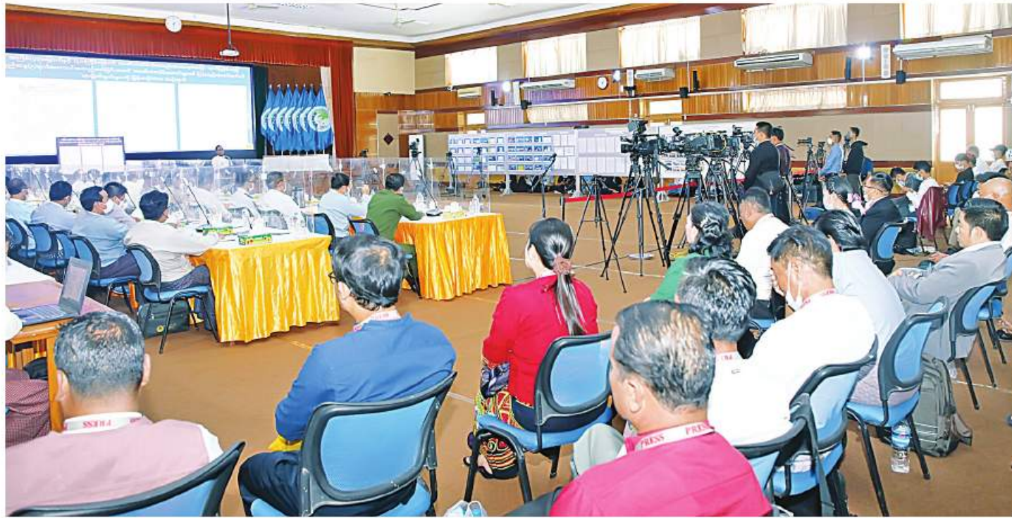
နိုင်ငံတော်စီမံအုပ်ချုပ်ရေးကောင်စီ သတင်းထုတ်ပြန်ရေးအဖွဲ့က သတင်းမီဒီယာများနှင့်တွေ့ဆုံ၍ သတင်းစာရှင်းလင်းပွဲပြုလုပ်စဉ်။

နေပြည်တော် နိုဝင်ဘာ ၁၈ နိုင်ငံတော်စီမံအုပ်ချုပ်ရေးကောင်စီ သတင်းထုတ်ပြန်ရေးအဖွဲ့၏ (၂၁)ကြိမ်မြောက် သတင်းစာရှင်းလင်းပွဲကို ယနေ့ နေ့လယ်ပိုင်းတွင် ပြန်ကြားရေးဝန်ကြီးဌာန၌ကျင်းပပြုလုပ်ခဲ့ရာ နိုင်ငံတော်စီမံအုပ်ချုပ်ရေးကောင်စီ သတင်းထုတ်ပြန်ရေးအဖွဲ့ ခေါင်းဆောင် ဗိုလ်ချုပ်ဇော်မင်းထွန်း၊ ပြည်ထောင်စုရွေးကောက်ပွဲကော်မရှင်အဖွဲ့ဝင် ဦးခင်မောင်ဦး၊ ဌာနဆိုင်ရာများမှ ပြောရေးဆိုခွင့်ရှိသူများနှင့် ဌာနဆိုင်ရာသတင်းထုတ်ပြန်ရေးအဖွဲ့ ကိုယ်စားလှယ်များက သတင်းမီဒီယာများ၏ သိရှိလိုသည့် မေးမြန်းမှုများကို ပြန်လည်ဖြေကြားသည်။ ဦးစွာ နိုင်ငံတော်စီမံအုပ်ချုပ်ရေးကောင်စီ သတင်းထုတ်ပြန်ရေးအဖွဲ့ ခေါင်းဆောင် ဗိုလ်ချုပ်ဇော်မင်းထွန်းက နိုင်ငံတော်အစိုးရအနေဖြင့် ဂုဏ်ထူးဆောင်ဘွဲ့၊ ဂုဏ်ထူးဆောင်တံဆိပ်များ ချီးမြှင့်ခြင်းဆိုင်ရာကိစ္စရပ်များ၊ ပြစ်ဒဏ်ကျခံနေရသူများကို ပြစ်ဒဏ်များမှ ဖြေလျှော့သက်ညှာစွာ စာမျက်နှာ ၂၁ ကော်လံ ၁ ☆