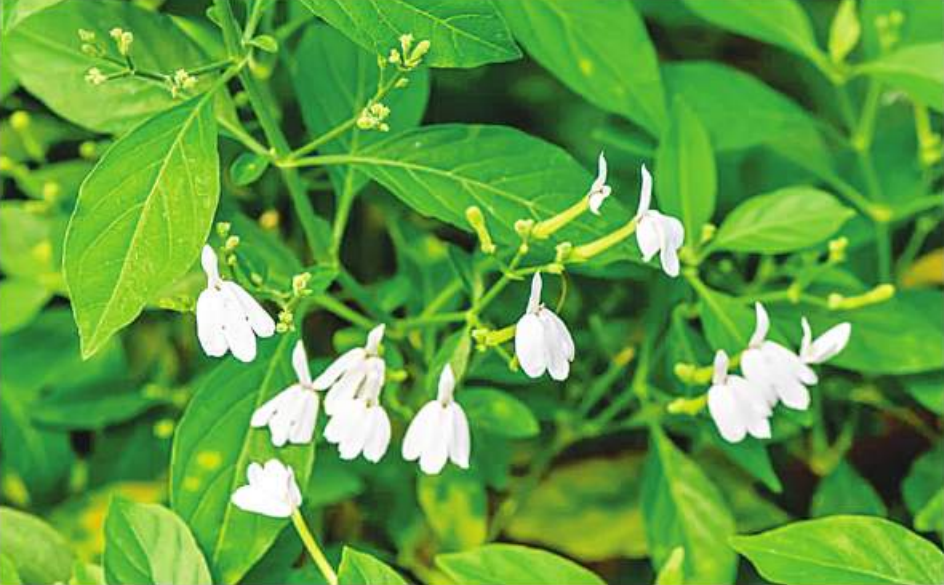
ဆေးဖက်ဝင် ထောလပတ်ရွက်ကို တွေ့ရစဉ်။

မေး ။ ။ ဆရာကြီးရင့် ကျွန်မက ငယ်ငယ်ကတည်းက စကားထစ်ပါတယ်။ အမြဲမဟုတ်ပါဘူး။ ခိတ်ပျော်နေချိန်ဆို ထစ်ပါတယ်။ ခိတ်ညှစ်နေချိန်၊ ခိတ်ခတ်ကျနေချိန်ဆို ပြောမရအောင် ထစ်နေတဲ့အတွက် အလုပ်မှာ အနှောင့်အယှက်ဖြစ်ရပါတယ်။ ခိတ်အားလဲငယ်ပါတယ်။ ကိုယ့်ကိုယ်ကိုယ် ယုံကြည်မှုလဲမရှိပါဘူး။ အလုပ်က စက်ချုပ်တဲ့အလုပ်ပါ။ တချို့တွေပြောတာ အာရုံကြောအားနည်းလို့ စကားထစ်တာလို့ပြောပါတယ်။ အဲဒါ ဟုတ်၊ မဟုတ် လူကောင်းပကတိဖြစ်အောင် ဘယ်လိုဆေးတွေစားရမလဲ၊ လေ့ကျင့်ခန်းလုပ်ရမယ်ဆိုလဲ လုပ်ပါမယ်။ စကားထစ်တာပျောက်ချင်လို့ အစားအသောက်အနေအထိုင် ဘယ်လိုကျင့်ကြံနေထိုင်ရမလဲဆိုတာ ပြောပြပေးပါဆရာရင့်။