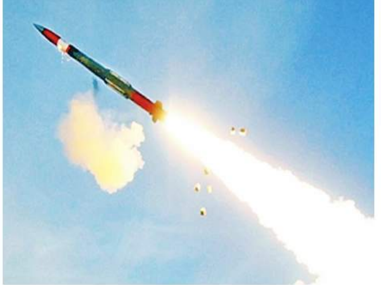
ပံ့ပိုးကူညီမှုများအတွက် ဆွစ်ဇာလန်သို့ သွားရောက်ရန် လိုအပ်မည်ဖြစ်ကြောင်း သိရသည်။ Switzerland purchasing 72 Patriot PAC 3 MSE air defense missiles ကို အာသာပြန်ဆိုထားပါသည်။

ဒေါ်လာသန်း ၇၀၀ ဖြစ်ကြောင်း သိရသည်။ အဆိုပါရောင်းချမှုသည် ဆွစ်ဇာလန်နိုင်ငံပိုင်နက်နယ်မြေ ကာကွယ်ရေးတိုးတက်ကောင်းမွန်စေရန်အပြင် အမေရိကန်၊ NATO တပ်ဖွဲ့များနှင့်အပြန်အလှန် ပူးပေါင်းဆောင်ရွက်နိုင်ရေး အထောက်အကူဖြစ်စေရန်အတွက်လည်း ရည်ရွယ်လုပ်ဆောင်ခြင်းဖြစ်သည်။ အမိကကန်ထရိုက်တာမှာ Texas ပြည်နယ်၊ Dallas မြို့အခြေစိုက် Lockheed Martin ကုမ္ပဏီဖြစ်သည်။ အဆိုပါ ရောင်းချမှုကို အကောင်အထည်ဖော်ရန်အတွက် အမေရိကန်အစိုးရ တာဝန်ရှိသူ ငါးဦးနှင့် ကန်ထရိုက်တာ ကုမ္ပဏီကိုယ်စားလှယ် ငါးဦးတို့သည် စက်ပစ္စည်းကိရိယာများပြုပြင်ခြင်း၊ ကွင်းဆင်းခြင်းနှင့် နည်းပညာ၊ ထောက်ပံ့ပို့ဆောင်ရေးဆိုင်ရာ