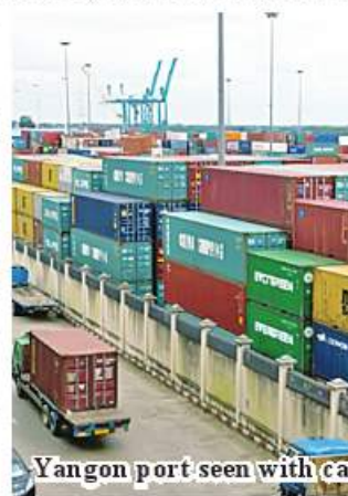
Yangon port seen with cargo containers.

During the seven month period, agricultural produce