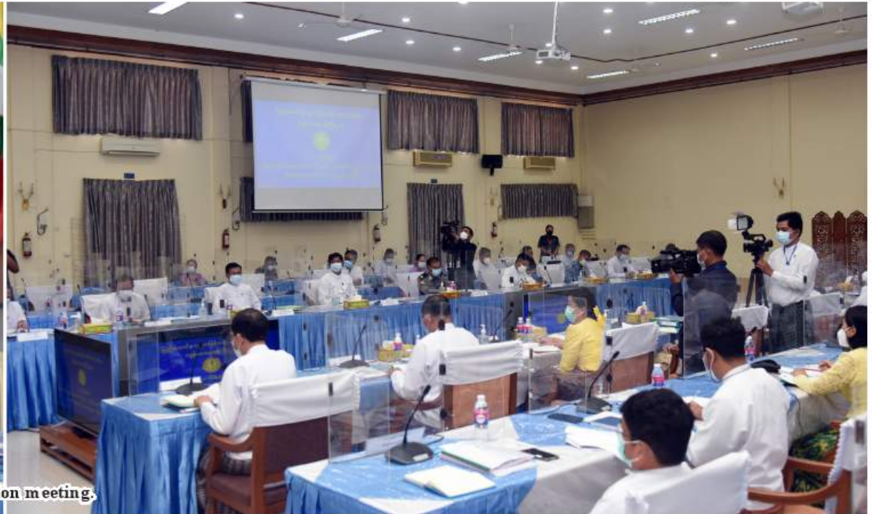
Vice-Senior General Soe Win addresses the work coordination meeting.

Nay Pyi Taw November 16 Steering Committee to hold 21 st Myanmar Traditional Practitioners Conference and Myanmar Traditional Medicine Seminar and work committee held work coordination meeting at Ministry of Health here this afternoon, addressed by Patron of the steering committee Vice Chairman of State Administration Council Deputy Prime Minister Vice-Senior General Soe Win.