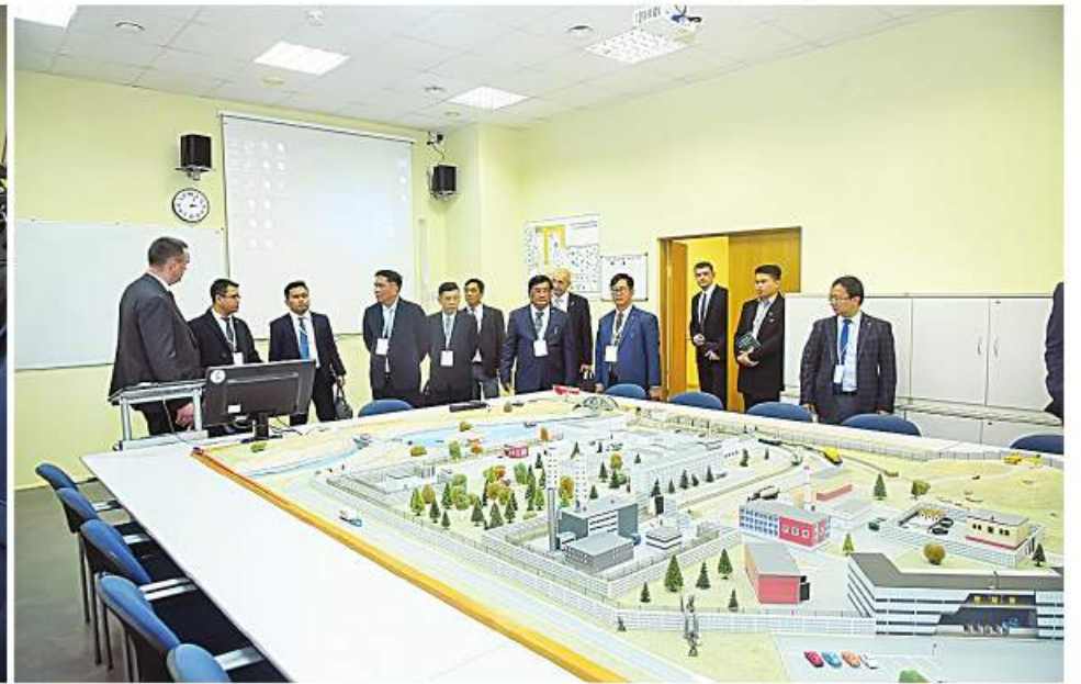
ပြည်ထောင်စုဝန်ကြီး ဦးသောင်းဟန်နှင့် ဒေါက်တာမျိုးသိန်းကျော်တို့ ဦးဆောင်သည့် မြန်မာကိုယ်စားလှယ်အဖွဲ့ မော်စကိုမြို့ရှိ Obninsk တက္ကသိုလ်၊ Rosatom Technical Academy နှင့် ကမ္ဘာ့ပထမဆုံး နျူကလီးယားဓာတ်အားပေးစက်ရုံ Obninsk Nuclear Power Plant တို့သို့ သွားရောက်လေ့လာစဉ်။

နေပြည်တော် နိုဝင်ဘာ ၁၆ ရုရှားဖက်ဒရေးရှင်းနိုင်ငံတွင် ရောက်ရှိနေသည့် လျှပ်စစ်စွမ်းအားဝန်ကြီးဌာန ပြည်ထောင်စုဝန်ကြီး ဦးသောင်းဟန်နှင့် သိပ္ပံနှင့်နည်းပညာဝန်ကြီးဌာန ပြည်ထောင်စုဝန်ကြီး ဒေါက်တာမျိုးသိန်းကျော်တို့ ဦးဆောင်သည့် မြန်မာကိုယ်စားလှယ်အဖွဲ့သည် ရုရှားဖက်ဒရေးရှင်းနိုင်ငံဆိုင်ရာ မြန်မာသံအမတ်ကြီး ဦးလွင်ဦးနှင့် တာဝန်ရှိသူများလိုက်ပါလျက် နိုဝင်ဘာ ၁၅ ရက်တွင် မော်စကိုမြို့ရှိ Obninsk တက္ကသိုလ်၊ Rosatom Technical Academy နှင့် ကမ္ဘာ့ပထမဆုံး နျူကလီးယားဓာတ်အားပေးစက်ရုံ Obninsk Nuclear Power Plant တို့သို့ သွားရောက်လေ့လာကြသည်။