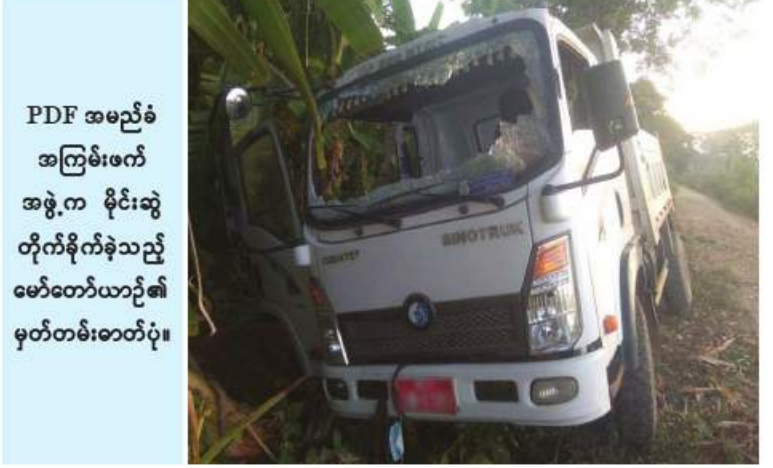
PDF အမည်ခံ အကြမ်းဖက် အဖွဲ့က မိုင်းဆွဲ တိုက်ခိုက်ခဲ့သည့် ဖော်တော်ယာဉ်၏ မှတ်တမ်းဓာတ်ပုံ။

နံနက် ၇ နာရီခန့်တွင် သေဆုံးသွား ခဲ့သည်။ PDF အမည်ခံအကြမ်းဖက်သမားများ အနေဖြင့် စစ်ရေးနှင့်မသက်ဆိုင်သည့် အပြစ်မဲ့ ရဟန်းသံဃာများ၊ ပြည်သူများနှင့် ဝန်ထမ်းများကို အကြမ်းဖက်တိုက်ခိုက် သတ်ဖြတ်ခြင်းများ မကြာခဏပြုလုပ်လျက် ရှိသကဲ့သို့ အရပ်ဘက်ဖော်တော်ယာဉ် များကိုလည်း အကြောင်းမဲ့မိုင်းဆွဲတိုက်ခိုက် ခြင်းများ ပြုလုပ်လျက်ရှိခြင်းကြောင့် အပြစ်မဲ့ပြည်သူများ ထိခိုက်ဒဏ်ရာရရှိခြင်း နှင့် သေဆုံးခြင်းများဖြစ်ပေါ် လျက်ရှိ ကြောင်း သတင်းရရှိသည်။