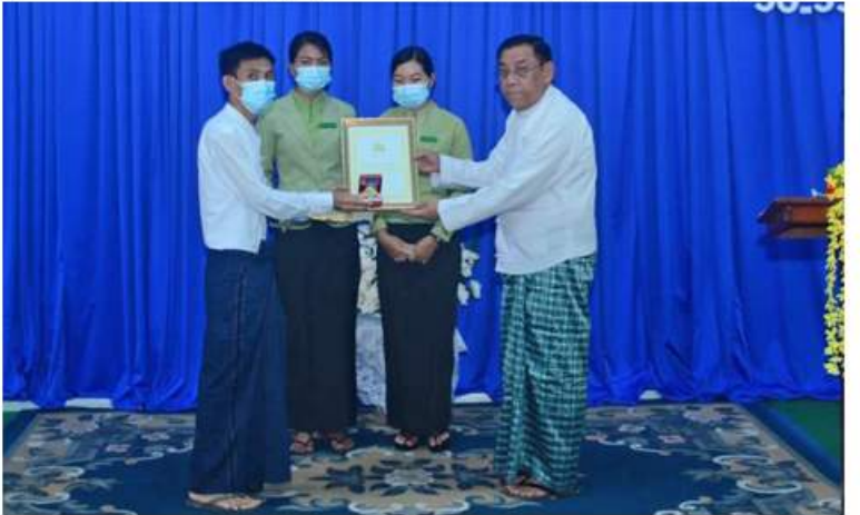
တနင်္သာရီတိုင်းဒေသကြီး ဝန်ကြီးချုပ် ဦးမြတ်ကို မြိတ်ခရိုင်အတွင်းမှ ရဲပလ တံဆိပ်ရရှိသူများကို ရဲပလတံဆိပ်နှင့် ဂုဏ်ပြုမှတ်တမ်းလွှာများ ပေးအပ်ချီးမြှင့်စဉ်။

ဦးစွာ တိုင်းဒေသကြီးဝန်ကြီးချုပ်က အမှာစကားပြောကြားသည်။ ထို့နောက် တိုင်းဒေသကြီးဝန်ကြီးချုပ်နှင့် တိုင်းမှူးတို့ က ရဲပလတံဆိပ်နှင့် ဂုဏ်ပြုမှတ်တမ်းလွှာ ချီးမြှင့်ခြင်းခံရသူများကို ရဲပလတံဆိပ်နှင့် ဂုဏ်ပြုမှတ်တမ်းလွှာအား အသီးသီး ပေးအပ်ချီးမြှင့်ရာ မိဘဆွေမျိုးများက လက်ခံရယူခဲ့ကြပြီး တာဝန်ရှိသူတစ်ဦးက ကျေးဇူးတင်စကား ပြန်လည်ပြောကြား သည်။ ယင်းနောက် တိုင်းဒေသကြီး ဝန်ကြီးချုပ်နှင့် တိုင်းမှူးတို့က တက်ရောက် လာကြသူများကို ရင်းရင်းနှီးနှီးလိုက်လံ နှုတ်ဆက်ခဲ့ကြောင်း သတင်းရရှိသည်။