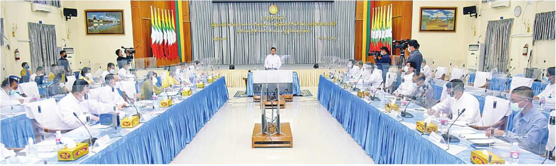
နိုင်ငံတော်စီမံအုပ်ချုပ်ရေးကောင်စီဒုတိယဥက္ကဋ္ဌ ဒုတိယဝန်ကြီးချုပ် ဒုတိယဝိုင်းချုပ်မှူးကြီးစိုးဝင်း (၂၁)ကြိမ်မြောက် မြန်မာ့တိုင်းရင်းဆေးသမားတော်များညီလာခံနှင့် မြန်မာ့တိုင်းရင်းဆေးပညာနိုးနှောပလ္လင်ပွဲကျင်းပရေးဦးစီးကော်မတီနှင့် လုပ်ငန်းကော်မတီညှိနှိုင်းအစည်းအဝေးတွင် အမှာစကားပြောကြားစဉ်။

နေပြည်တော် နိုဝင်ဘာ ၁၆ ၊ လုပ်ငန်းကော်မတီညှိနှိုင်းအစည်းအဝေးကို ယနေ့ များညီလာခံနှင့် မြန်မာ့တိုင်းရင်းဆေးပညာ တက်ရောက်အမှာစကားပြောကြားသည်။ (၂၁)ကြိမ်မြောက် မြန်မာ့တိုင်းရင်းဆေးသမား မွန်းလွဲပိုင်းတွင် နေပြည်တော်ရှိ ကျန်းမာရေး နိုးနှောပလ္လင်ပွဲကျင်းပရေးဦးစီးကော်မတီနာယက အစည်းအဝေးသို့ (၂၁)ကြိမ်မြောက် မြန်မာ့တော်များညီလာခံနှင့် မြန်မာ့တိုင်းရင်းဆေးပညာ ဝန်ကြီးဌာနအစည်းအဝေးခန်းမ၌ ကျင်းပရာ နိုင်ငံတော်စီမံအုပ်ချုပ်ရေးကောင်စီ ဒုတိယဥက္ကဋ္ဌ တိုင်းရင်းဆေးသမားတော်များညီလာခံနှင့် နိုးနှောပလ္လင်ပွဲကျင်းပရေး ဦးစီးကော်မတီနှင့် (၂၁)ကြိမ်မြောက် မြန်မာ့တိုင်းရင်းဆေးသမားတော် ဒုတိယဝန်ကြီးချုပ် ဒုတိယဝိုင်းချုပ်မှူးကြီးစိုးဝင်း စာမျက်နှာ ၁၆ ကော်လံ ၁ B