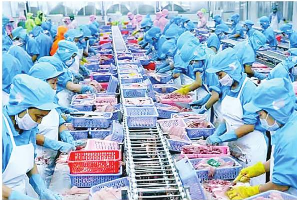
နေပြည်တော် နိုဝင်ဘာ ၁၆

ယခုဘဏ္ဍာနှစ် ဧပြီ ၁ ရက်မှ အောက်တိုဘာ ၃၁ ရက်ထိ တရုတ်နိုင်ငံသို့ အမေရိကန်ဒေါ်လာသန်း ၁၃၀ ကျော်တန်ဖိုးရှိ ရေထွက်ပို့ကုန်တန်ချိန် ၅၃၀၀၀ ကျော် တင်ပို့ရောင်းချပေးခဲ့ကြောင်း ငါးလုပ်ငန်းဦးစီးဌာန သတင်းများအရ သိရသည်။