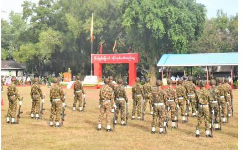
အရှေ့တောင်တိုင်းစစ်ဌာနချုပ် တိုင်းမှူး ဝိုလ်ချုပ်မြတ်သက်ဦး (၆၁)နှစ်မြောက် တိုင်းနှစ်ပတ်လည်နေ့အထိမ်းအမှတ် စစ်ရေးပြအစမ်းအမှတ် မိန့်ခွန်းပြောကြားစဉ်။

ဆက်လက်ပြုလုပ်ရာ နယ်မြေလုံခြုံရေး လုပ်ငန်းများတွင် စွမ်းစွမ်းတမ်းဆောင်ရွက် ခဲ့ကြသည့် အရာရှိ၊ စစ်သည်များနှင့် မြန်မာနိုင်ငံရဲတပ်ဖွဲ့ဝင်များ၊ သင်တန်းများ၊ အားကစားပြိုင်ပွဲများနှင့် ပြိုင်ပွဲအသီးသီး တွင် ဆုရရှိကြသူများ၊ ပညာရည်ချွန်ဆုနှင့် အိမ်ထောင်သည်လိုင်း ဘက်စုံအကောင်း ဆုံးဆုရရှိကြသူများကို တိုင်းမှူးနှင့် တာဝန်ရှိသူများက ဂုဏ်ပြုဆုများ အသီး သီးပေးအပ်ချီးမြှင့်ကြသည်။