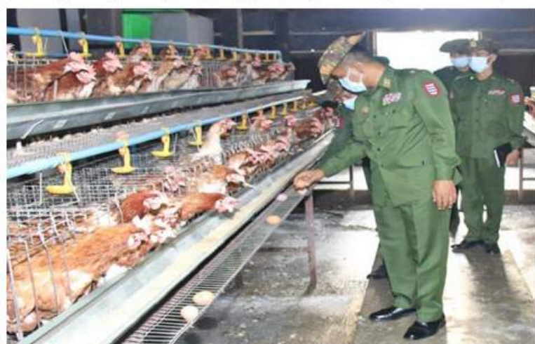
အနောက်တောင်တိုင်းစစ်ဌာနချုပ် တိုင်းမှူး ဝိုလ်ချုပ်မြတ်သက်ဦး ပုသိမ်မြို့ရှိ စံပြဘက်စုံစိုက်ပျိုးရေးနှင့် မွေးမြူရေးခြံ၌ ဥဗားကြက်မွေးမြူထားရှိမှုကို ကြည့်ရှု စစ်ဆေးစဉ်။

နေပြည်တော် နိုဝင်ဘာ ၁၆ ကိုဗစ်-၁၉ ရောဂါ ဖြစ်ပွားမှုကြောင့် ရောဂါ ကာကွယ်၊ ထိန်းချုပ်၊ ကုသရေး လုပ်ငန်းများဆောင်ရွက်နေချိန်တွင် ဒေသ တွင်း စားနပ်ရိက္ခာဖူလုံရေးနှင့် ပြည့်သူများ ၏ စားသောက်ရေးကို အထောက်အကူ ပြစ်စေရန်အတွက် တိုင်းစစ်ဌာနချုပ်များ၊ တပ်ရင်း၊ တပ်ဖွဲ့များ၌ စိုက်ပျိုးမွေးမြူရေး လုပ်ငန်းများကို ဆောင်ရွက်လျက်ရှိသည်။ ထိုသို့ဆောင်ရွက်လျက်ရှိရာ ယနေ့တွင် အနောက်တောင်တိုင်းစစ်ဌာနချုပ် တိုင်းမှူး ဝိုလ်ချုပ်မြတ်သက်ဦးနှင့် အဖွဲ့ဝင်များက ပုသိမ်မြို့ရှိ စံပြဘက်စုံစိုက်ပျိုးရေးနှင့် မွေးမြူရေးခြံ၌လည်းကောင်း၊ တောင်ပိုင်း တိုင်းစစ်ဌာနချုပ် တိုင်းမှူး ဝိုလ်ချုပ်ထိန်ဝင်း နှင့်အဖွဲ့ဝင်များက တောင်ငူတပ်နယ်၊ နယ်မြေခံတပ်ရင်းရှိ စံပြဘက်စုံ စိုက်ပျိုးရေး နှင့် မွေးမြူရေးခြံ၌လည်းကောင်း စိုက်ပျိုး မွေးမြူရေးလုပ်ငန်းများကို အသီးသီး လုပ်ငန်းများ ရှာနှုန်းပြည့်ဆောင်ရွက်နိုင်ရေး သွားရောက်ကြည့်ရှုစစ်ဆေးပြီး တာဝန်ရှိသူ များနှင့်တွေ့ဆုံကာ ကုန်ထုတ်လုပ်မှု ဆောင်ရွက်ပေးခဲ့ကြောင်း သတင်းရရှိသည်။