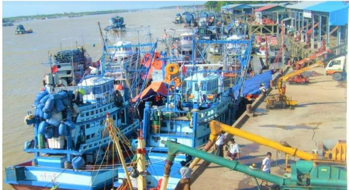
ရန်ကုန် နိုဝင်ဘာ ၁၆

မြန်မာ့ပင်လယ်ပြင်အတွင်း ငါးဖမ်းဆီး ရာတွင် ဈေးကွက်၌ဈေးကောင်းရရှိ လျက်ရှိရာ ရန်ကုန်မြို့ရှိ ငါးဖမ်းစက်လှေ များဆိုက်ကပ်ရာ ဆိပ်ကမ်းကိုးခု၌ ပင်လယ်ပြင် ရေထွက်ကုန်ပို့ဆောင်သော စက်လှေများဖြင့် စည်ကားလျက်ရှိကြောင်း သိရသည်။ မြန်မာ့ပင်လယ်ပြင်အတွင်း ပွင့်လင်း ရာသီအစ နိုဝင်ဘာလတွင် ငါး၊ ပုစွန်အထိ အမိကောင်းမှုကြောင့် ပြည်တွင်းစားသုံးမှု