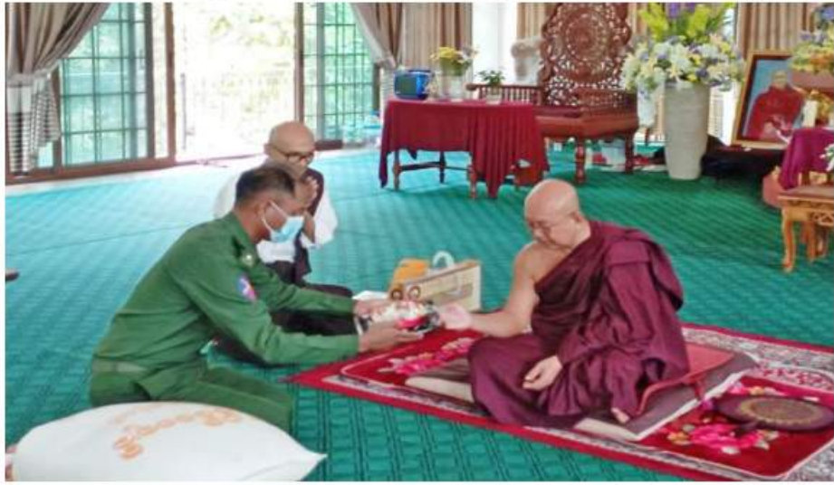
ရန်ကုန်တိုင်းဒေသကြီး မှော်ဘီမြို့နယ် ပျော်ဘွယ်စုကျေးရွာရှိ ဖားအောက်ရိပ်သာ ရွှေသစ္စာ တောရကျောင်းတိုက် ဆရာတော်ထံ မှော်ဘီတပ်နယ်မှ တာဝန်ရှိသူများက ဆွမ်းဆန်တော်၊ ဆီနှင့် လှူဖွယ်ဝတ္ထု ပစ္စည်းများ ဆက်ကပ်လှူဒါန်းစဉ်။

နေပြည်တော် နိုဝင်ဘာ ၁၆ ကိုဗစ်-၁၉ ရောဂါ ကြိုတင်ကာကွယ် ရေးလုပ်ငန်းများ ဆောင်ရွက်နေသည့် ကာလအတွင်း ဆွမ်းကိစ္စရပ်များ အဆင် ပြေစေရန်ရည်ရွယ်၍ တပ်မတော်(ကြည်း၊ ရေ၊ လေ) အရာရှိ၊ စစ်သည်၊ အရာထမ်း၊ အမှုထမ်းများနှင့် စေတနာရှင်အလှူရှင် များက မြို့နယ်အသီးသီးရှိ ဘုန်းတော်ကြီး ကျောင်းများ၊ သာသနာ့ဌာနဝင် သီလရှင် ကျောင်းများ၊ ဘာသာရေးကျောင်းများနှင့် ဘိုးဘွားရိပ်သာများသို့ ဆွမ်းဆန်တော်၊ ဆီ၊ ဆား၊ ပဲ အမည်လေးမျိုးနှင့် လှူဖွယ် ပစ္စည်းများလှူဒါန်းခြင်း၊ နေ့ဆွမ်းများ ဆက်ကပ်လှူဒါန်းခြင်းနှင့် လိုအပ်သည့် ကျန်းမာရေးစစ်ဆေးကုသပေးခြင်းများကို ဆောင်ရွက်လျက်ရှိသည်။