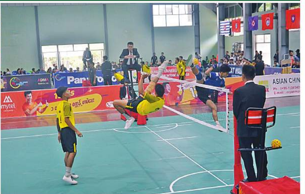
၂၀၂၂ ခုနှစ် တပ်မတော်(ကြည်း၊ ရေ၊ လေ) အားကစားပြိုင်ပွဲများ ကျင်းပစဉ်။

နေပြည်တော် နိုဝင်ဘာ ၁၆ ၂၀၂၂ ခုနှစ် တပ်မတော်(ကြည်း၊ ရေ၊ လေ) အားကစားပြိုင်ပွဲများကို ဒုတိယနေ့အဖြစ် ယနေ့ နံနက်ပိုင်းတွင် သက်ဆိုင်ရာအားကစားနည်းများ