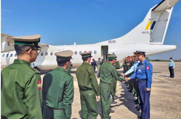
ဝေးလံခေါင်းပါးသည့်ဒေသများသို့ သွားရောက်တာဝန်ထမ်းဆောင်မည့် တပ်မတော်မှ ပါရဂူများ၊ ဆေးမှူးများကို ကာကွယ်ရေးဦးစီးချုပ်ရုံး(ကြည်း)မှ တွဲဖက်စစ်ရေးချုပ် ဗိုလ်ချုပ်လှိုင်စိုးနှင့် တာဝန်ရှိသူများက နေပြည်တော်လေဆိပ်တွင် ပို့ဆောင် နှုတ်ဆက်စဉ်။

နေပြည်တော် နိုဝင်ဘာ ၁၆ တပ်မတော်ကာကွယ်ရေးဦးစီးချုပ်ရုံး၏ လမ်းညွှန်ချက်ဖြင့် စစ်ကိုင်းတိုင်းဒေသကြီး နှင့် ချင်းပြည်နယ်တို့ရှိ ဝေးလံခေါင်းပါး၍ လမ်းပန်းဆက်သွယ်ရေး ခက်ခဲသည့်ဒေသ များ၌ ဒေသခံပြည်သူများ၏ ကျန်းမာရေး မြှင့်တင်ရန်အတွက် ဆရာဝန်လိုအပ်ချက် ရှိသည့်ဆေးရုံများတွင် မိမိတို့၏ သဘော ဆန္ဒအလျောက် သွားရောက် တာဝန် ထမ်းဆောင်ရန် ဆန္ဒပြုထားသည့် တပ်မတော်မှပါရဂူများ၊ ဆေးမှူးများပါဝင် သည့် တပ်မတော်သားဆရာဝန် ၁၈ ဦး သည် ယနေ့နံနက်ပိုင်းတွင် နေပြည်တော်