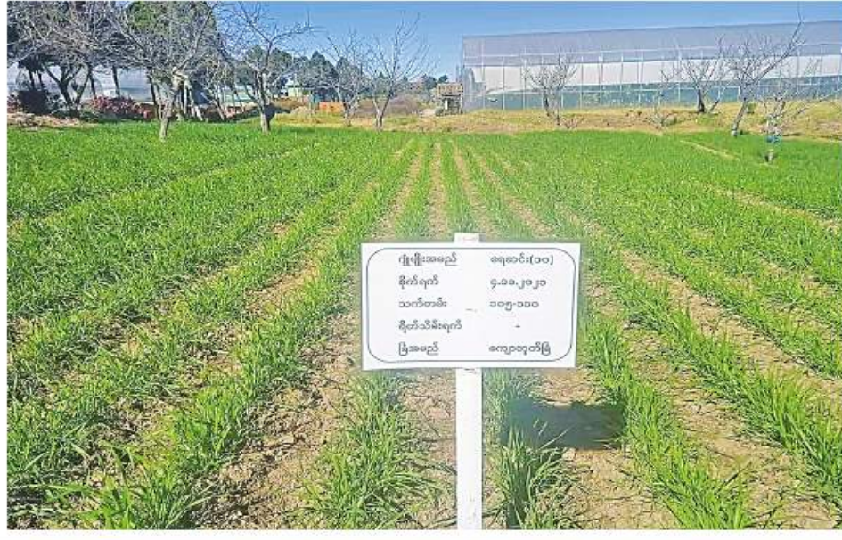
မျိုးစေ့စာမည် စေ့စောင်း(၁၀) စိုက်ရက် ၄.၁၁.၂၀၂၁ သက်တမ်း ၁၀၅-၁၁၀ စိုက်သီးရက် မြေပဲမည် ကျောသုတ်မြေ

၈၅ ဧက၊ နေကြာ ၁၁၂ ဧက၊ ကုလားပဲ ၃၅ ဧက၊ အစေ့ထုတ် ပြောင်း တစ်ဧက၊ ဆီမုန်ညင်း ၁၀ ဧက၊ အာလူး ၂၂၅ ဧက၊ ဂျုံဧက ၂၄၀၊ စားတော်ပဲဧက ၂၀၀ စုစု ပေါင်း ၉၀၈ ဧက စိုက်ပျိုးလျက် ရှိကြောင်း ချင်းပြည်နယ် စိုက်ပျိုး ရေးဦးစီးဌာနမှ သိရသည်။