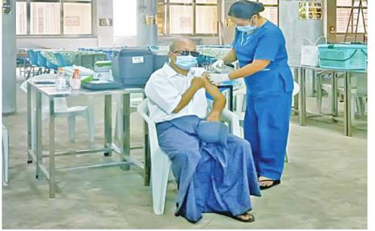
ရန်ကုန်တိုင်းဒေသကြီး ရန်ကင်းမြို့နယ်အတွင်းရှိ ဒေသခံပြည်သူများကို ကိုဗစ်-၁၉ ရောဂါ ကာကွယ်ဆေးများ ထိုးနှံပေးစဉ်။

နေပြည်တော် နိုဝင်ဘာ ၁၄ ကိုဗစ်-၁၉ ရောဂါ ကာကွယ် ဆေးထိုးနှံခြင်းသည် အဓိကအခန်းကဏ္ဍတွင် ပါဝင်သည့် လုပ်ငန်းတစ်ရပ်ဖြစ်သောကြောင့် တိုင်းဒေသကြီးနှင့် ပြည်နယ်အသီးသီးတွင် ကာကွယ်ဆေးထိုးနှံခြင်းကို အင်တိုက် အားတိုက်ဆောင်ရွက်လျက်ရှိရာ ယနေ့ တွင် ရန်ကုန်တိုင်းဒေသကြီး ရန်ကင်း မြို့နယ်၌ ဒေသခံပြည်သူဦးရေ ၉၀၊ ရောဝတီတိုင်းဒေသကြီးအတွင်းရှိ မြို့နယ် ၂၆ မြို့နယ်တို့၌ ဒေသခံပြည်သူ ၁၅၄၇ ဦးနှင့် မန္တလေးတိုင်းဒေသကြီးအတွင်းရှိ ခရိုင်ခုနစ်ခုတို့မှ ဒေသခံပြည်သူ ၁၅၆၃ ဦးတို့ကို တပ်မတော်မှ ဆေးအဖွဲ့များက ပြည်သူဆေးရုံများမှ ဆရာဝန်များ၊ သက်ဆိုင်ရာ ကျန်းမာရေးဝန်ထမ်းများ၊ စေတနာ့ဝန်ထမ်းများနှင့် ပူးပေါင်း၍ ကိုဗစ်-၁၉ ရောဂါကာကွယ်ဆေး ထိုးနှံ ပေးခြင်းများ ဆောင်ရွက်ပေးသည်။ ထို့ပြင် ကိုဗစ်-၁၉ ရောဂါ ထိန်းချုပ် ကာကွယ်ရာတွင် အထောက်အကူဖြစ်စေ ရန်အတွက် Mask များကို ပြည်သူများ လက်ဝယ်အရောက် တိုင်းစစ်ဌာနချုပ် အသီးသီးမှ တာဝန်ရှိသူများက အခမဲ့ ပေးဝေလျှော့ဒါန်းလျက်ရှိရာ ယနေ့တွင် ရန်ကုန်တိုင်းဒေသကြီးအတွင်းရှိ မြို့နယ် ၄၄ မြို့နယ်တို့၌ စာသင်ကျောင်းများ၊ ဈေးများ၊ လမ်းများ၊ မြို့အဝင်ဝိတ်များနှင့် လူစည်ကားရာနေရာများတွင် နယ်မြေခံ တပ်မတော်သားများက ခရိုင်၊ မြို့နယ်စီမံ အုပ်ချုပ်ရေးအဖွဲ့မှ တာဝန်ရှိသူများ၊ ဌာနဆိုင်ရာဝန်ထမ်းများ၊ ပရဟိတအဖွဲ့များ နှင့်ပူးပေါင်း၍ ကိုဗစ်-၁၉ ရောဂါ ကာကွယ် ရေးအတွက် အသိပညာပေးဆောင်ရွက် ခြင်း၊ Mask များ တပ်ဆင်ပြီးသွားလာကြရန် လှုံ့ဆော်ခြင်းနှင့် Mask များကို ဒေသခံ ပြည်သူများလက်ဝယ်အရောက် အခမဲ့ ပေးဝေလျှော့ဒါန်းခဲ့ကြောင်း သတင်း ရရှိသည်။