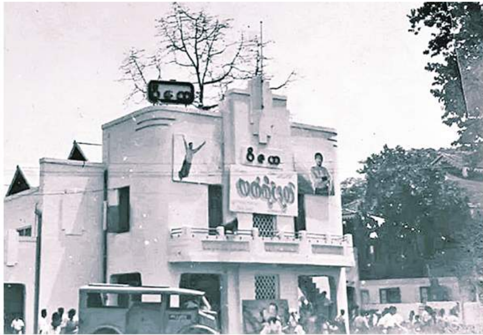
အနစ် ၂၀ စီးပွားရေးစီမံကိန်းကာလအတွင်းက ရန်ကုန်မြို့၊ ဦးဝိစာရလမ်းနှင့် ဓမ္မစေတီလမ်းထောင့်၌တည်ရှိခဲ့သော ဝိဇယရုပ်ရှင်ရုံ။