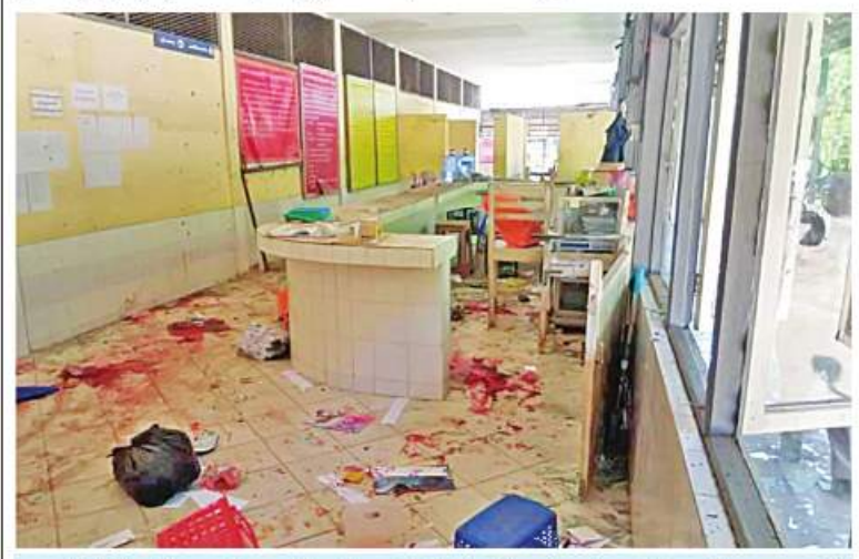
အင်းစိန်ဗဟိုအကျဉ်းထောင် ဝင်ထွက်ပေါက် ပါဆယ်ထုပ်လက်ခံသည့် အဆောက် အအုံအား အကြမ်းဖက်သမားများက လက်လုပ်မိုင်းဖြင့် ဖောက်ခွဲတိုက်ခိုက်ခဲ့သဖြင့် ပေါက်ကွဲမှုဖြစ်ပွားခဲ့သည့် မှတ်တမ်းဓာတ်ပုံ။

သမားများသည် ဒေသတွင်းအားကစားပြိုင်ပွဲများတွင်သာမက ကမ္ဘာ့အဆင့်စစ်စစ်ပွဲများတွင်လည်း နိုင်ငံ့ဂုဏ်ဆောင် ဆုတံဆိပ်များရွာကို ရယူပေးနိုင်ခဲ့ကြသည်ကို ဝမ်းမြောက်ဂုဏ်ယူ ဖွယ်တွေ့မြင်ခဲ့ရပါသည်။ ဝင်ရောက်ယှဉ်ပြိုင်သမျှ ပြိုင်ပွဲတိုင်း တွင် တပ်မတော်သားကောင်းပီပီ မဆုတ်မနစ်သော ဇွဲလုံ့လ ဝီရိယတို့ဖြင့် ယှဉ်ပြိုင်ခဲ့ကြလေသည်။ ထိုသို့ယှဉ်ပြိုင်သည့် အားကစားသမားများကို မြင်တွေ့ရခြင်းမှတစ်ဆင့် ယင်းတို့၏ သက်ဆိုင်ရာ နိုင်ငံအသီးသီး၏ စိတ်ပိုင်းရုပ်ပိုင်းဆိုင်ရာများကို အခြားသောနိုင်ငံများက မှတ်တမ်းတင်သွားတတ်ကြပါသည်။ မျက်မှောက်ကာလတွင် အားကစားပွဲများကို ဗဟိုပြုလျက် နိုင်ငံတစ်နိုင်ငံ၏ အမျိုးသားရေးကိုယ်ခံစွမ်းအားများ မည်မျှ တောင့်တင်းခိုင်မာကြောင်းကို သုံးသပ်လျက်ရှိနေကြပါသည်။ မည်သို့ပင်ဆိုစေကာမူ သစ္စာလေးချက် ဦးထိပ်ရွက်ထားပြီး အစဉ်အလာ(၁၂)ရပ်အတိုင်း ပြုမူကျင့်ကြံနေထိုင်ကြသော တပ်မတော်သားများပီပီ ယနေ့ယှဉ်ပြိုင်ကြတော့မည့် တပ်မတော် (ကြည်း၊ ရေ လေ)အားကစားပြိုင်ပွဲကြီးတွင် မိမိတို့ယှဉ်ပြိုင်ကြမည့် အားကစားကဏ္ဍများအလိုက် ရေကန်ရေခန်းယှဉ်ပြိုင်ကြပြီး တပ်မတော်လက်ရွေးစင်များမှတစ်ဆင့် နိုင်ငံ့လက်ရွေးစင်များ ဖြစ်အောင်ကြိုးစားသွားကြမည်မှာ မြေကြီးလက်ခတ်မလွှဲပင်ဖြစ်ပါ ကြောင်းတင်ပြရင်း ၂၀၂၂ ခုနှစ် တပ်မတော် (ကြည်း၊ ရေ လေ) အားကစားပြိုင်ပွဲကြီးအား ဂုဏ်ပြုကြိုဆိုလိုက်ရပါသည်။ ။