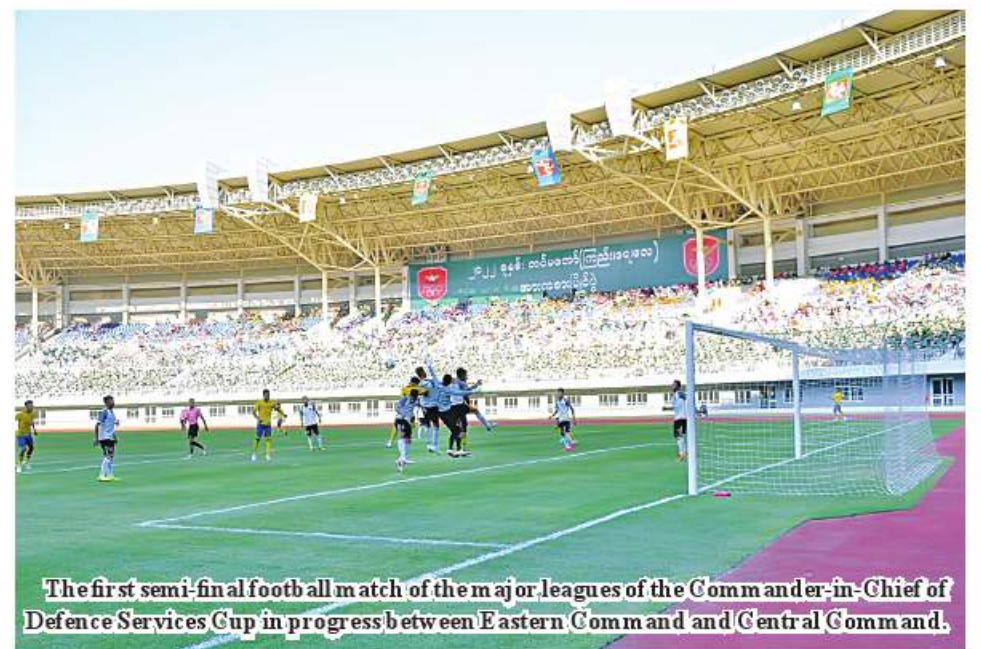
The first semi-final football match of the major leagues of the Commander-in-Chief of Defence Services Cup in progress between Eastern Command and Central Command.

Myanmar's martial arts which is one of sports events to be held today is a sport event showing off national spirit, braveness, activeness and physical fitness. In the past, Myanmar's art