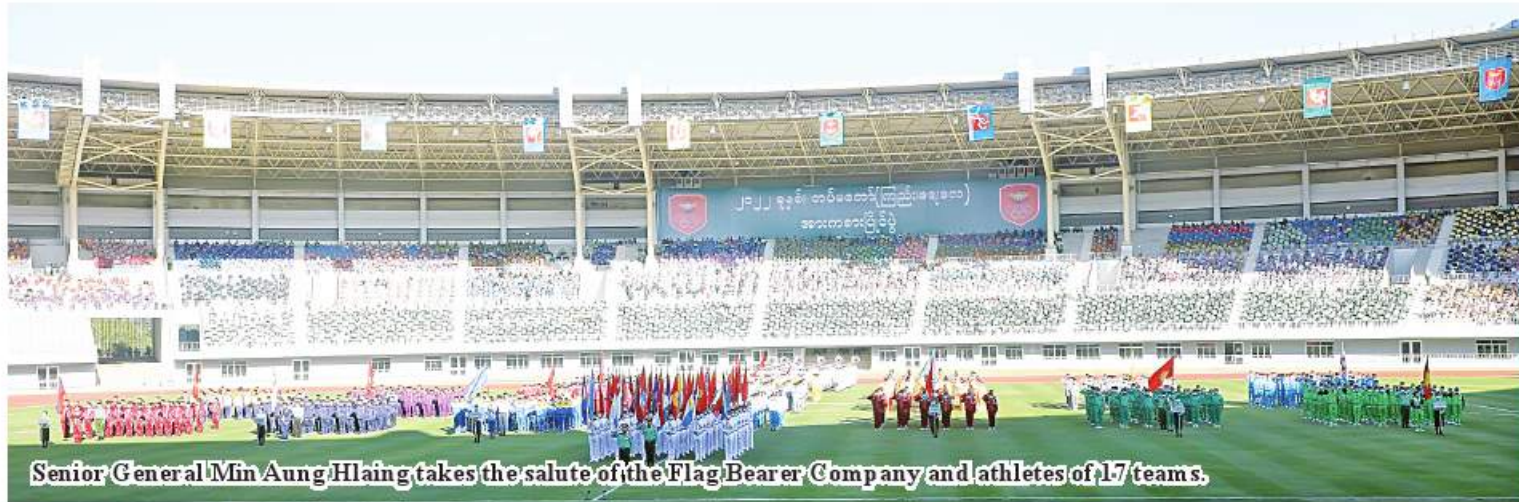
Senior General Min Aung Hlaing takes the salute of the Flag Bearer Company and athletes of 17 teams.