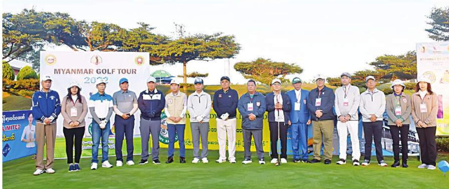
၂၀၂၂ ခုနှစ် မြန်မာပြည်တွင်းပတ်လည် ဂေါက်သီးရိုက်ပြိုင်ပွဲ (ပြင်ဦးလွင်ပွဲစဉ်) ဖွင့်ပွဲအခမ်းအနားတက်ရောက်လာကြသူများ အမှတ်တရ ရပေါင်းဓာတ်ပုံရိုက်စဉ်။

နေပြည်တော် နိုဝင်ဘာ ၁၄ မြန်မာနိုင်ငံတွင် ထူးချွန်သော ဂေါက်သီးရိုက် အားကစားသမားများ ပေါ်ထွက်လာစေရေး အတွက် မြန်မာနိုင်ငံ ဂေါက်သီးအားကစားအဖွဲ့ ချုပ်နှင့် မြန်မာပီဂျီအေတို့မှ စီစဉ်၍ Mytel Operator၊ မြဝတီဘဏ်လီမိတက်နှင့် အင်းဝဘဏ် လီမိတက်တို့မှ အဓိကကူညီပံ့ပိုးသည့် ၂၀၂၂ ခုနှစ် မြန်မာပြည်တွင်းပတ်လည် ဂေါက်သီးရိုက်ပြိုင်ပွဲ (ပြင်ဦးလွင်ပွဲစဉ်)ဖွင့်ပွဲကို ယနေ့ နံနက်ပိုင်းတွင် ပြင်ဦးလွင်မြို့ ချယ်ရီလွင်တပ်မတော်ဂေါက်ကွင်း၌ ကျင်းပပြုလုပ်ရာ အလယ်ပိုင်းတိုင်းစစ်ဌာနချုပ် တိုင်းမှူး ဗိုလ်ချုပ်ကိုကိုဦး၊ တပ်မတော်အရာရှိကြီး များ၊ Mytel Operator မှ တာဝန်ရှိသူများ၊ မြဝတီဘဏ်လီမိတက်မှ တာဝန်ရှိသူများ၊ အင်းဝ ဘဏ်လီမိတက်မှ စာမျက်နှာ ၁၈ ကော်လံ ၁ ☆