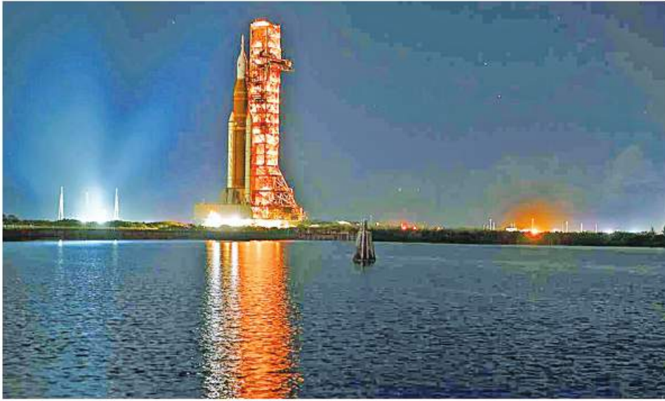
ဝါရှင်တန် နိုဝင်ဘာ ၁၄

အမေရိကန်အစိုးရ အမျိုးသား လေကြောင်းနှင့် အာကာသစီမံ ခန့်ခွဲရေး အေဂျင်စီ(နာဆာ)သည် နစ်ကိုးမုန်တိုင်းဒဏ်ခံခဲ့ရပြီး အသေးစားထိခိုက်ပျက်