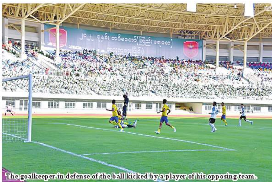
The goalkeeper in defense of the ball kicked by a player of his opposing team.

sharpening of sports skills of Tatmadaw member athletes and for giving chance for those to systematically take sports training. The Tatmadaw draws the annual sports calendar to organize the sports competitions in relevant military commands for producing the new generation athletes to be chosen for the selected Tatmadaw (Army, Navy and Air) teams. As uplifting the sports sector means protecting the State, all athletes try hard to secure success in their respective sports events so as to bring honour to the Tatmadaw and the State.