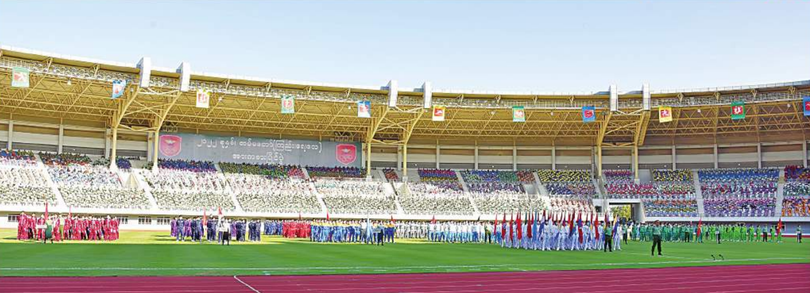
နိုင်ငံတော် စီမံအုပ်ချုပ်ရေးကောင်စီ ဥက္ကဋ္ဌ တပ်မတော်ကာကွယ်ရေးဦးစီးချုပ် ဗိုလ်ချုပ်မှူးကြီး မင်းအောင်လှိုင် ၂၀၂၂ ခုနှစ် တပ်မတော် (ကြည်း၊ ရေ၊ လေ) အားကစားပြိုင်ပွဲ ဖွင့်ပွဲအခမ်းအနားတွင် အဖွင့်မိန့်ခွန်းပြောကြားစဉ်။