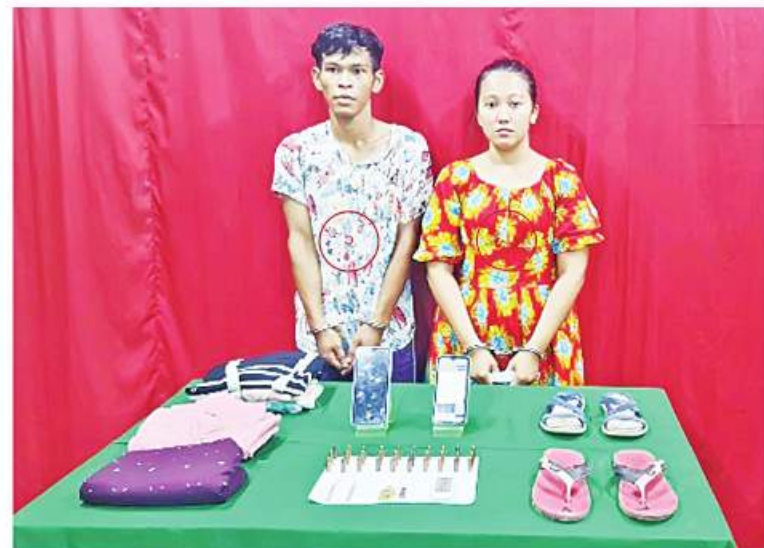
အင်းစိန်ဗဟိုအကျဉ်းထောင်ကို ပါဆယ်ထုပ်များအတွင်း လက်လုပ်မိုင်းတပ်ဆင် ကာ ဖောက်ခွဲမှုကျူးလွန်ခဲ့သည့် တရားစံများနှင့် ဖြစ်မှုကျူးလွန်စဉ်က ၎င်းတို့ဝတ်ဆင် အသုံးပြုခဲ့သည့် ပစ္စည်းများမှတ်တမ်းဓာတ်ပုံ။