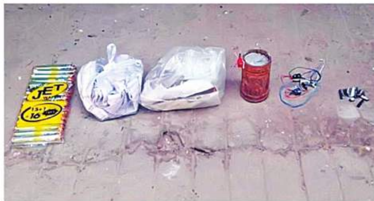
အင်းစိန်ဗဟိုအကျဉ်းထောင် ဝင်ထွက်ပေါက် ပါဆယ်ထုပ်လက်ခံသည့် အဆောက် အအုံ၌ အကြမ်းဖက်သမားများထောင်ထားခဲ့ပြီး မပေါက်ကွဲသေးသည့် လက်လုပ်မိုင်း တစ်လုံး သိမ်းဆည်းရမိမှု မှတ်တမ်းဓာတ်ပုံ။

လူဝင်မှုကြီးကြပ်ရေးနှင့် ပြည်သူ့အင်အားဝန်ကြီးဌာန