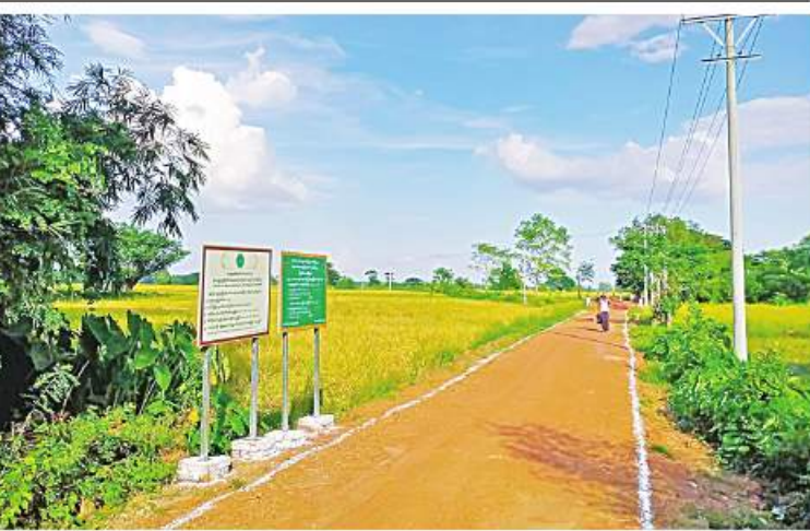
ရာ ကျေးရွာရှိ အိမ်ခြေ ၅၇ အိမ်၊ လူဦးရေ မြို့နယ် ကျေးလက်ဒေသဖွံ့ဖြိုးတိုးတက်ရေး ၂၃၀ တို့မှာ လက်ရှိတွင် အဆိုပါလမ်းကို ဦးစီးဌာန မြို့နယ်ဦးစီးမှူး ဦးပညာက အသုံးပြုနေပြီဖြစ်ကြောင်း ကြို့ပင်ကောက် ပြောပြ၍ သိရသည်။ ကိုညို

ကတတ်ကုန်းကျေးရွာ၌ ကျေးရွာဖွံ့ဖြိုးတိုးတက်ရေးလုပ်ငန်းစီမံကိန်း (VDP) ရန်ပုံငွေကျပ်သိန်း ၁၀၀ ဖြင့် အရှည်ပေ ၁၁၂၀၊ အကျယ် ၁၂ ပေ၊ အမြင့် ခြောက်လက်မရှိ ဂံမြေလမ်းခင်းခြင်းနှင့် အရှည် ၁၈ ပေ၊ အကျယ် သုံးပေ၊ အမြင့်သုံးပေရှိ Box Culvert တစ်စင်း တည်ဆောက်ခြင်းလုပ်ငန်းကို မြို့နယ်စီမံကိန်းတာဝန်ခံအင်ဂျင်နီယာများက နည်းပညာပံ့ပိုးကာ ကျေးရွာပြည်သူလူထုကိုယ်တိုင် ရှုထိန်းလုပ်ထိန်းပေးစေရန် စတင်ဆောင်ရွက်ခဲ့ရာ ယနေ့တွင် လုပ်ငန်းများအားလုံး ရာနှုန်းပြည့် ဆောင်ရွက်ပြီးစီးနေပြီဖြစ်