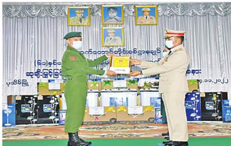
အနောက်တောင်တိုင်းစစ်ဌာနချုပ် တိုင်းမှူး ဗိုလ်မှူးချုပ်ကြည်ခိုင် (၆၁)နှစ်မြောက် တိုင်းနှစ်ပတ်လည်နေ့အခမ်းအနားတွင် ဆုရရှိသူတစ်ဦးကို ဆုပေးအပ်ချီးမြှင့်စဉ်။

နေပြည်တော် နိုဝင်ဘာ ၁၄ အနောက်တောင်တိုင်းစစ်ဌာနချုပ်၏ (၆၁)နှစ်မြောက် တိုင်းနှစ်ပတ်လည်နေ့ကို ဗိုလ်မှူးချုပ်ကြည်ခိုင်နှင့် တာဝန်ရှိသူများ၊