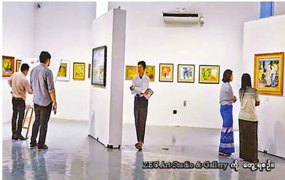
ZEC Art Studio & Gallery ကို တွေ့ရစဉ်။

ရန်ကုန် နိုဝင်ဘာ ၁၄ ရန်ကုန်တိုင်းဒေသကြီး သယံဇာတနှင့် ထိန်းသိမ်းရေး ဝန်ကြီးဌာနမှ ZEC Art Studio & Gallery တွင် စာနယ်ဇင်း လောကမှ ထင်ရှားသည့် ပန်းချီ ဆရာများ၏ ပန်းချီလက်ရာများကို စုစည်း၍ အွန်လိုင်းပန်းချီပြပွဲ ပြုသမည်ဖြစ်ကြောင်း ZEC Art Studio & Gallery ပြခန်း