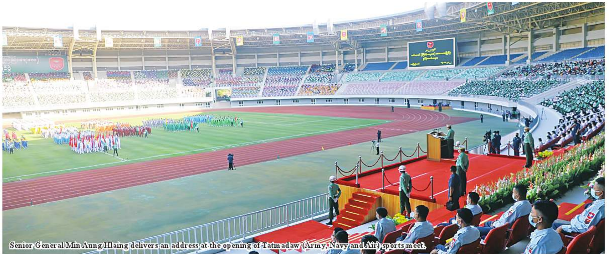
Senior General Min Aung Hlaing delivers an address at the opening of Tatmadaw (Army, Navy and Air) sports meet.