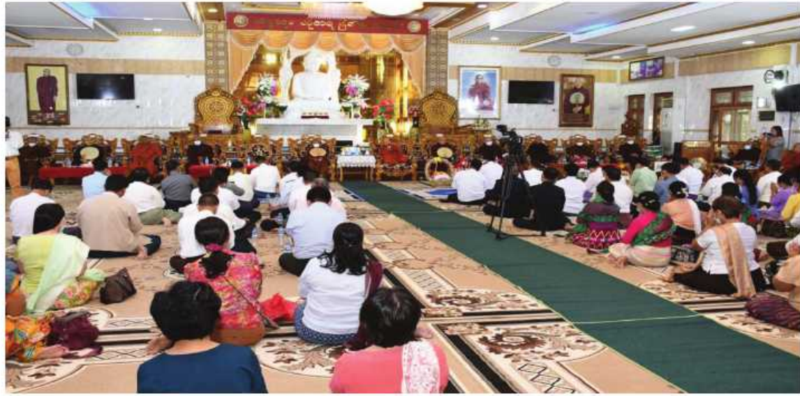
မဇ္ဈိမလင်္ကာရသမဏေကျော်စာမေးပွဲကျင်းပရေးလုပ်ငန်းညှိနှိုင်းအစည်းအဝေး ပြုလုပ်စဉ်။

နေပြည်တော် နိုဝင်ဘာ ၁၃ ရန်ကုန်တိုင်းဒေသကြီး လှည်းကူးမြို့နယ် ရဲမွန်တပ်မြို့ရှိ မဇ္ဈိမလင်္ကာရသမဏေကျော်စာမေးပွဲကျင်းပရေး လုပ်ငန်းညှိနှိုင်းအစည်းအဝေးပြုလုပ်ရာ အဘိဓမ္မဟာရဋ္ဌဂုရု အဂ္ဂမဟာပဏ္ဍိတ နိုင်ငံတော်ဩဝါဒါ စရိယ ရွှေတိဂုံစေတီတော်ဂေါပကအဖွဲ့ကြီး၏ ဩဝါဒါစရိယ အင်းစိန်မြို့နယ် ရွာမပရိယတ္တိစာသင်တိုက်ကြီး၏ ဦးစီးပဓာန နာယက ဘဒ္ဒန္တတိလောကာဘိဝံသ အမျိုးပြုသော သံဃာတော်များ ကြွရောက်တော်