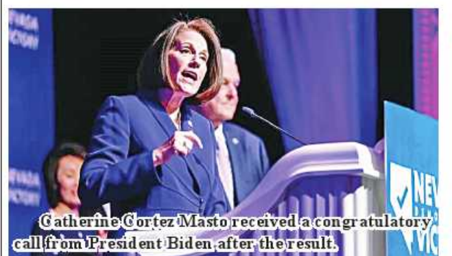
Catherine Cortez Masto received a congratulatory call from President Biden, after the result.