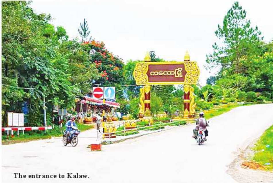
The entrance to Kalaw.

Kalaw November 13 Kalaw as a tourist capital in LED signs will be installed at the entrance of Kalaw City as part of the process of implementing