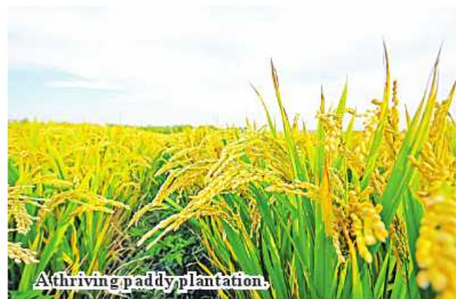
A thriving paddy plantation.

In addition, in order to be able to grow sunflowers as rain crops and winter crops in Kachin State, the department will also provide seeds and needs for the livestock sector. 336