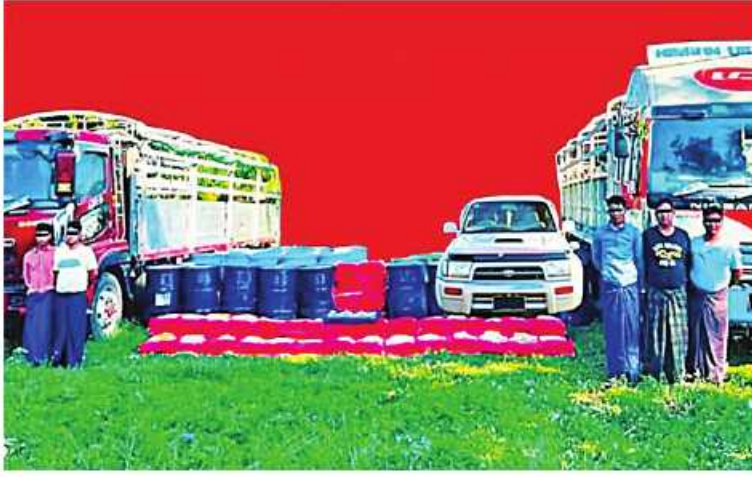
ဖမ်းဆီးရမိသူများကို သိမ်းဆည်းရမိသည့် ထိန်းချုပ်စာတုပစ္စည်းများနှင့်အတူ တွေ့ရစဉ်

နေပြည်တော် နိုဝင်ဘာ ၁၃ - မူးယစ်ဆေးဝါး တားဆီးနှိမ်နင်းရေး ခွဲစိတ်ဖွဲ့စည်းမှုများပါဝင်သော ပူးပေါင်း ကျေးရွာအနီးတွင် အောင်သန့်ဝင် (ခ) နိုဝင်ဘာ ၁၂ ရက် နံနက် ၉ နာရီခွဲတွင် ကျိုက်ထိုမြို့နယ် လက်ပြဲ