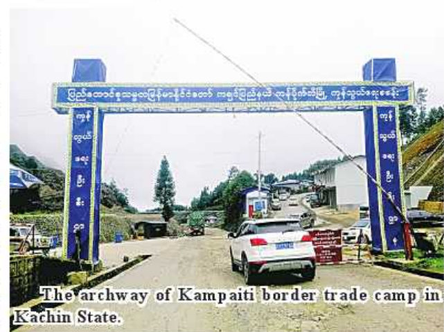
The archway of Kampaiti border trade camp in Kachin State.

officially register with the GACC," he said. ASH