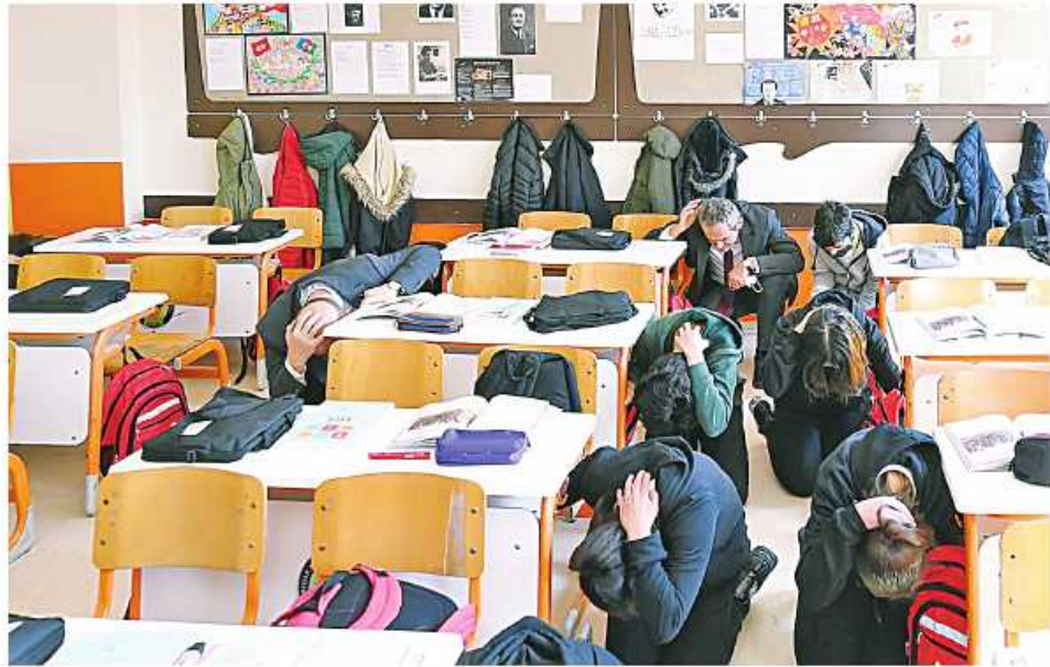
အင်ကာရာ နိုဝင်ဘာ ၁၃

တူရကီနိုင်ငံသည် မြေငလျင် မကြာခဏလှုပ်ခတ်နေသည့်အတွက် ကြောင့် မြေငလျင်လှုပ်ခတ်သည့် အခြေအနေတွင် သေဆုံးမှုများ၊ ထိခိုက်ဒဏ်ရာရရှိမှုများ အနည်းဆုံးဖြစ်စေရန်အတွက် မြေငလျင် အန္တရာယ်ဓာတ်တိုက်လေ့ကျင့်မှုကို တစ်နိုင်ငံလုံးအတိုင်းအတာဖြင့် နိုဝင်ဘာ ၁၂ ရက်က ပြုလုပ်ခဲ့