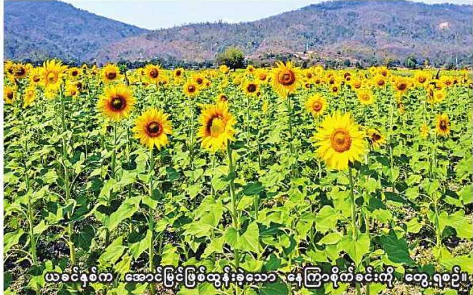
ယခင်နှစ်က အောင်မြင်ဖြစ်ထွန်းခဲ့သော နေကြာစိုက်ခင်းကို တွေ့ရစဉ်။

စစ်ကိုင်း နိုဝင်ဘာ ၁၃ စစ်ကိုင်းတိုင်းဒေသကြီး အတွင်း ယခုနှစ် ဆောင်းသီးနှံစိုက်ပျိုးချိန်၌ ဆီထွက် သီးနှံစိုက်ပျိုးမှုအနေဖြင့် ၁၆၂၁၇၈ ကေ စိုက်ပျိုးပြီးစီးနေပြီဖြစ်ကြောင်း စစ်ကိုင်းခရိုင် စိုက်ပျိုးရေးဦးစီးဌာန မှ သိရသည်။