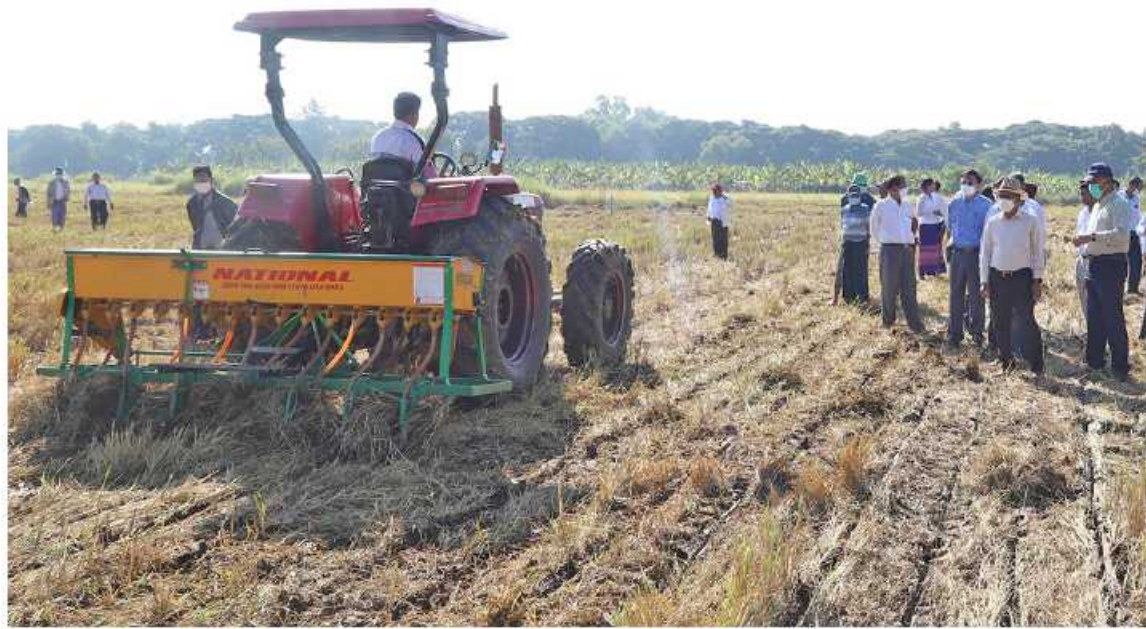
နေပြည်တော် နိုဝင်ဘာ ၁၃

ကုန်ကျစရိတ်သက်သာစွာဖြင့် သီးထပ်သီးနံ့များကို ရာသီအချိန်မီစိုက်ပျိုးနိုင်မှသာ တစ်ကောင်၏ စိုက်ပျိုးထုတ်လုပ်မှု တိုးတက်လာပြီး တောင်သူများ ဝင်ငွေပိုမိုရရှိစေမည်ဖြစ်ကြောင်း၊ ထယ်ရေးမလိုသော မျိုးစေ့ချက်ရိယာအသုံးပြုခြင်းဖြင့် ထွက်နှုန်းကြီးအသုံးပြုမှုမှ ကြုံတွေ့ရမည့် မြေသိပ်သည်းမှုကို မြေလျှော့နိုင်မည်ဖြစ်ကြောင်း စိုက်ပျိုးရေး၊ မွေးမြူရေးနှင့်ဆည်မြောင်းဝန်ကြီးဌာန ပြည်ထောင်စုဝန်ကြီး ဦးတင်ထွဋ်ဦးက ပြောကြားသည်။