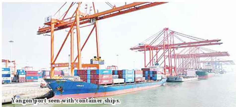
Yangon port seen with container ships.

Yangon November 13 A direct shipping route from the Beibu Gulf Port in China to Yangon city of Myanmar has been officially opened, according to the Chinese Embassy to Myanmar in Yangon. China opened the Beibu Gulf Port-RCEP (Regional Comprehensive Economic Partnership) regional water-