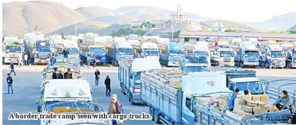
A border trade camp seen with cargo trucks.