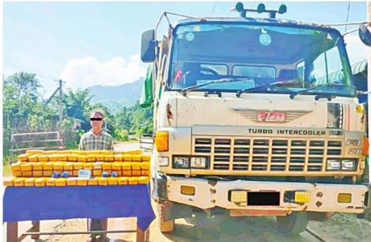
နေပြည်တော် နိုဝင်ဘာ ၁၀

ရှမ်းပြည်နယ်(တောင်ပိုင်း) ပင်လောင်းမြို့နယ်တွင် ငွေကျပ်သိန်း ၇၀၀၀ ကျော် တန်ဖိုးရှိ စိတ်ကြွေးသွပ်ဆေးပြား ၁ ဒသမ ၄ သန်းကျော် ပမ်းဆီးရမိခဲ့ကြောင်း