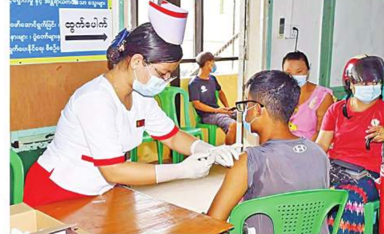
ရခိုင်ပြည်နယ် ကျောက်ဖြူမြို့နယ်ရှိ ဒေသခံပြည်သူများကို ကိုဗစ်-၁၉ ရောဂါ ကာကွယ်ဆေးများ ထိုးနှံပေးစဉ်။

နေပြည်တော် နိုဝင်ဘာ ၁၀ ကိုဗစ်-၁၉ ရောဂါ ကာကွယ် ဆေးထိုးနှံခြင်းသည် အဓိကအခန်းကဏ္ဍတွင် ပါဝင်သည် လုပ်ငန်းတစ်ရပ်ဖြစ်သောကြောင့် တိုင်းဒေသကြီးနှင့် ပြည်နယ်အသီးသီးတို့၌ ကာကွယ်ဆေးထိုးနှံခြင်းကို အင်တိုက်အားတိုက်ဆောင်ရွက်လျက်ရှိရာ ယနေ့တွင် ရောဂါတိုင်းဒေသကြီးအတွင်းရှိ မြို့နယ် ၂၆ မြို့နယ်တို့၌ ဒေသခံပြည်သူ ၁၆၅၉ ဦး၊ ရခိုင်ပြည်နယ် ကျောက်ဖြူမြို့နယ်နှင့် တောင်ကုတ်မြို့နယ်တို့၌ ဒေသခံပြည်သူ ၃၆၄ ဦးနှင့် မန္တလေးတိုင်းဒေသကြီးအတွင်းရှိ ခရိုင်ခုနစ်ခုတို့မှ ဒေသခံပြည်သူ ၂၅၃၅ ဦးတို့ကို တပ်မတော်မှ ဆေးအဖွဲ့များက ပြည်သူ့ဆေးရုံများမှ ဆရာဝန်များ၊ သက်ဆိုင်ရာ ကျန်းမာရေးဝန်ထမ်းများ၊ စေတနာ့ဝန်ထမ်းများနှင့် ပူးပေါင်း၍ ကိုဗစ်-၁၉ ရောဂါကာကွယ်ဆေးထိုးနှံပေးခြင်းများ ဆောင်ရွက်ပေးသည်။ ထို့အတူ ကျောင်းသား၊ ကျောင်းသူများကိုလည်း ကိုဗစ်-၁၉ ရောဂါကာကွယ်ဆေး