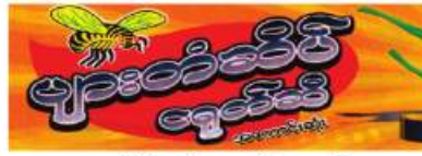
မှတ်ပုံတင်စာချုပ်အမှတ် (၄/၆၂၄၆/၂၀၂၂)