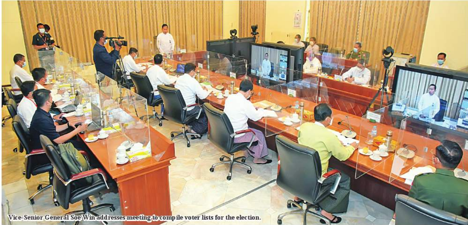
Vice-Senior General Soe Win addresses meeting to compile voter lists for the election.