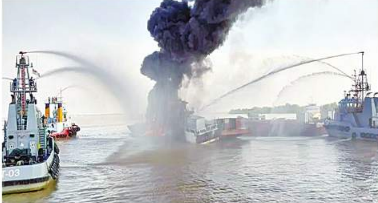
မီးလောင်မှုဖြစ်ပွားနေသည့် တွန်းသင်္ဘောတစ်စီးကို တပ်မတော်(ရေ)မှ စစ်ရေယာဉ် များဖြင့် ဝိုင်းဝန်းမီးငြိမ်းသတ်စဉ်။

သွားတွဲဆွဲရေယာဉ် သုံးစီးသည် ဒေသခံ ငါးဖမ်းလှေများနှင့်အတူ ဝိုင်းဝန်း မီးငြိမ်းသတ်ခဲ့ရာ ညနေ ၄ နာရီခန့်တွင် မီးငြိမ်းသွားခဲ့သည်။ အဆိုပါ မီးလောင်ရသည့်အကြောင်းရင်း ကို သက်ဆိုင်ရာက ဖော်ထုတ်ဆောင်ရွက် လျက်ရှိကြောင်း သတင်းရရှိသည်။