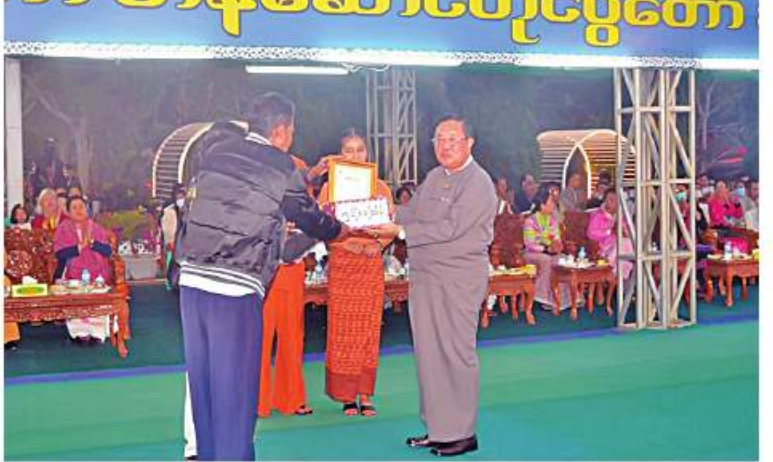
ရုမ်းပြည်နယ်ဝန်ကြီးချုပ် ဒေါက်တာကျော်ထွန်း တန်ဆောင်တိုင်မီးပုံးပျံပွဲတော်တွင် ဆုရရှိသူတစ်ဦးကို ဆုပေးအပ်ချီးမြှင့်စဉ်။

နေပြည်တော် နိုဝင်ဘာ ၁၀ ရုမ်းပြည်နယ်(တောင်ပိုင်း) တောင်ကြီးမြို့ သစ်တောရပ်ကွက်ရှိ စုဠာမုနိ လောကချမ်းသာစေတီတော်ရင်ပြင်၌ တန်ဆောင်တိုင်မီးပုံးပျံပွဲတော် ဆုချီးမြှင့်ခြင်းနှင့် ဂုဏ်ပြုမှတ်တမ်းလွှာပေးအပ်ပွဲကို နိုဝင်ဘာ ၉ ရက် ညနေပိုင်းတွင် အဆိုပါစေတီတော်ရင်ပြင်၌ ပြုလုပ်ရာ ပြည်နယ်ဝန်ကြီးချုပ် ဒေါက်တာကျော်ထွန်း၊ အရှေ့ပိုင်းတိုင်း စစ်ဌာနချုပ် တိုင်းမှူး ဗိုလ်ချုပ်လှိုင်နှင့် အဖွဲ့ဝင်များ၊ ပြည်နယ်ဝန်ကြီးများ၊ ဗိုလ်အဖွဲ့များ၊ ဆုရရှိကြသူများနှင့် ဒေသခံတိုင်းရင်းသားပြည်သူများ တက်ရောက်ကြသည်။ ဦးစွာ ပြည်နယ်ဝန်ကြီးချုပ်၊ တိုင်းမှူးနှင့် တာဝန်ရှိသူများက စိန်နားပန်းမီးပုံးပျံ လွှတ်တင်ပူဇော်ခဲ့ကြသော အေးသာယာမြို့နှင့် တောင်ကြီးမြို့တို့မှ ယှဉ်ပြိုင်ခဲ့ကြသော မြေနစ်ချောင်း၊ မြေလေးချောင်းပြိုင်ပွဲတို့တွင် ဆုရရှိကြသူများ၊ မီးပဒေသာ လှည့်လည်ပူဇော်ပွဲတွင် ပါဝင်ခဲ့ကြသော တောင်ကြီးမြို့ပေါ် ၂၂ ရပ်ကွက်မှ အဖွဲ့များ၊ ဗိုလ်အဖွဲ့များနှင့် မီးဆရာအဖွဲ့များကို ဂုဏ်ပြုမှတ်တမ်းလွှာနှင့် ဂုဏ်ပြုဆုငွေများ ချီးမြှင့်ခဲ့ကြသည်။ ထို့နောက် တန်ဆောင်တိုင်မီးပုံးပျံပွဲတော် ဆုချီးမြှင့်ခြင်းနှင့် ဂုဏ်ပြုမှတ်တမ်းလွှာပေးအပ်ပွဲကို မီးရှူး၊ မီးပန်းများ ပစ်ပေါက်ပူဇော်ခဲ့ကြကြောင်း သတင်းရရှိသည်။