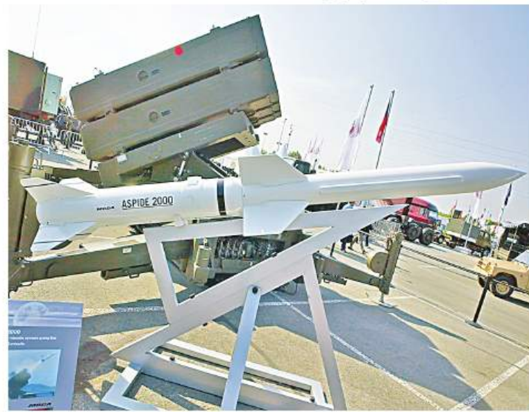
ထားပြီးဖြစ်သည်။ Ukrainian defense minister reveals new missile systems ကို ဘာသာပြန်ဆိုထားပါသည်။

ဘက်နေရာများကို ပစ်မှတ်ထားတိုက်ခိုက်သည့် ယူကရိန်းဖောက်ခွဲမှုအများအပြားကို လက်တုံ့ပြန်သည့်အနေဖြင့် တိုက်ခိုက်ခဲ့ခြင်းဖြစ်ကြောင်း အတိအလင်း ပြောကြား