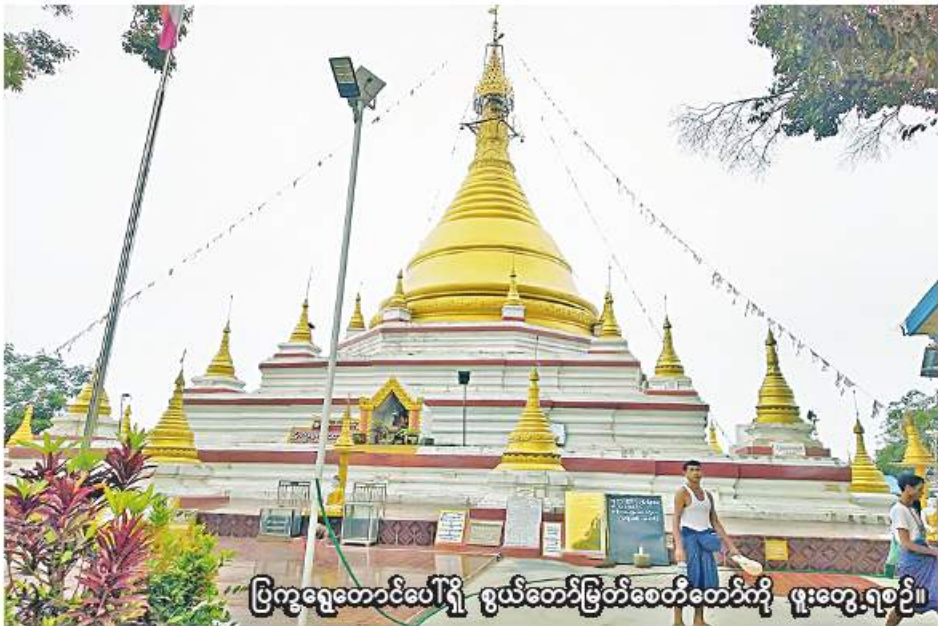
ပြက္ခရွေ့တောင်ပေါ်ရှိ စွယ်တော်မြတ်စေတီတော်ကို ဖူးတွေ့ရစဉ်။

အနောက်တောင်ကို တက်ရောက်ရတဲ့ခရီးက တစ်တောင်တစ်တောင်တက်၊ တစ်တောထွက် တစ်တောင်ဆင်း တက်လိုက်ဆင်းလိုက် တောလမ်းခရီးစစ်စစ်ဖြစ်ပါတယ်။ အဆင်းခရီးလမ်းထက် အတက်ခရီးလမ်းက ပိုမိုများပြားပါတယ်။ အဆင်းခရီးမှာ မသိမသာလေး ခပ်ပြေပြေဆင်းသွားခဲ့ပေမဲ့ အတက်ခရီးတွေမှာ မောဟိုက်ပြီး ချွေးဒီးဒီးကျအောင် ပင်ပင်ပန်းပန်း တက်ရောက်ကြရတာပါ။ ခရီးလမ်းအခြေအနေက တောင်ကျချောင်းရေတွေ စီးဆင်းနေကျ ပြောင်ပြောင်ချောချော၊ ရှင်းရှင်းလင်းလင်း နေရာတွေ