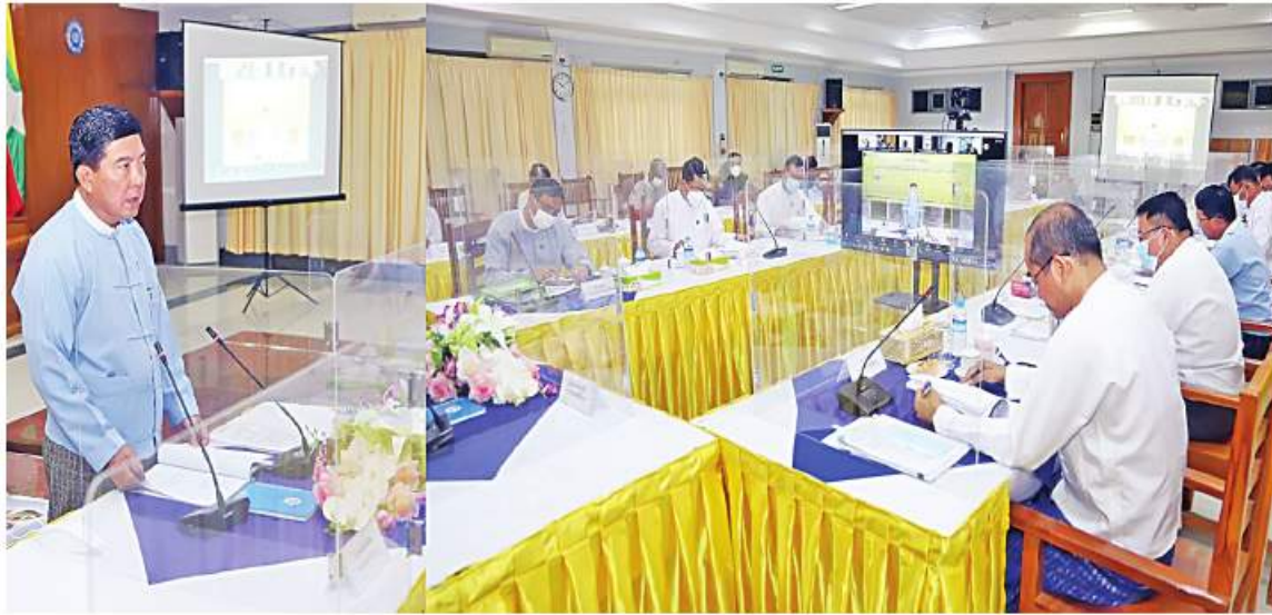
နေပြည်တော် နိုဝင်ဘာ ၁၀

အလုပ်လက်ခံဖြစ်ပေါ်နေသည့် အလုပ်သမားများကို New Normal အခြေအနေနှင့်အညီ အသစ်ဖွင့်လှစ်လုပ်ကိုင်သည့် စက်ရုံများနှင့် ချိတ်ဆက်ဆောင်ရွက်ပေးရန်၊ ပြည်ပမှပြန်လည်ဝင်ရောက်လာသည့် အလုပ်သမားများကို ၎င်းတို့၏ ကျွမ်းကျင်မှုနှင့်ကိုက်ညီသော အလုပ်အကိုင်ရရှိရေး ဆောင်ရွက်ပေးရန်နှင့် ၎င်းတို့ တတ်မြောက်ထားသည့် နည်းပညာများကို သင့်လျော်သည့်နေရာများတွင် ပြန်လည်အသုံးပြုနိုင်ရေး ချိတ်ဆက်ဆောင်ရွက်သွားကြရန် ပြည်ထောင်စုဝန်ကြီး ဒေါက်တာပွင့်ဆန်းက ယနေ့နေ့လယ်ပိုင်းက အလုပ်သမားဝန်ကြီးဌာန၌ ကျင်းပသည့် CMP လုပ်ငန်းများ ကြီးကြပ်ရေးကော်မတီ တတိယအကြိမ် လုပ်ငန်းညှိနှိုင်းအစည်းအဝေးတွင် တာဝန်ရှိသူများကို မှာကြားခဲ့သည်။ ထို့ပြင် ပြည်ထောင်စုဝန်ကြီးက မြန်မာနိုင်ငံတွင် အလုပ်အကိုင်အခွင့်အလမ်းများ အများဆုံးဖော်ဆောင်ပေးပြီး ပြည်ပဝင်ငွေရှာဖွေပေးနေသည့် CMP လုပ်ငန်းများသည် မြန်မာလုပ်သားထုနှင့် မြန်မာနိုင်ငံသားများအတွက် ရေတို၊ ရေရှည် အကျိုးဖြစ်ထွန်းစေသည့် စီးပွားရေးလုပ်ငန်းများ