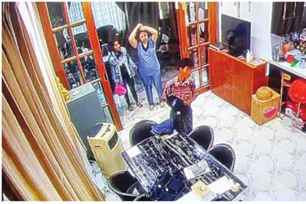
ဆိုင်အတွင်းသို့ PDF အမည်ခံ အကြမ်းဖက်သမားများ ဝင်ရောက်ခဲ့ပြီး လက်ဝတ်ရတနာများနှင့် လက်ကိုင်ဖုန်းများအား ခြိမ်းခြောက်ယူဆောင် ခဲ့မှုကို တွေ့ရစဉ်။

အမည်ခံ အကြမ်းဖက်သမားများအနေဖြင့် အပြစ်မဲ့အမျိုးသမီးများနှင့် ကလေးသူငယ် များကို အတင်းအဓမ္မနှောင်ဖမ်းဆီးခြင်း၊ အပြစ်မဲ့ပြည်သူများ၊ နိုင်ငံ့ဝန်ထမ်းများကို အကျပ်ကိုင် ခြိမ်းခြောက်ချုပ်နှောင်ခြင်း များသည် ဂျီနီဗာကွန်ဗင်းရှင်းများနှင့် အပြည်ပြည်ဆိုင်ရာ ဥပဒေတို့အရ စစ်ရာဇဝတ်မှု (War Crime) ကျူးလွန်ရာ ရောက်ပြီး အဆိုပါစစ်ရာဇဝတ်မှုများအတွက် အကြမ်းဖက်မှုတိုက်ဖျက်ရေးဥပဒေ၊ ရာဇ သတ်ကြီးနှင့် သက်ဆိုင်ရာ တည်ဆဲဥပဒေ များဖြင့် ၎င်းတို့အပေါ် ထိရောက်စွာအရေး ယူနိုင်ရေး လုံခြုံရေးတပ်ဖွဲ့ဝင်များက အကြမ်းဖက်ချေမှုန်းရေး ဆောင်ရွက်မှု (Counter-terrorism Action) ဆောင်ရွက် မှု သွားမည်ဖြစ်ကြောင်းနှင့် အများပြည်သူ