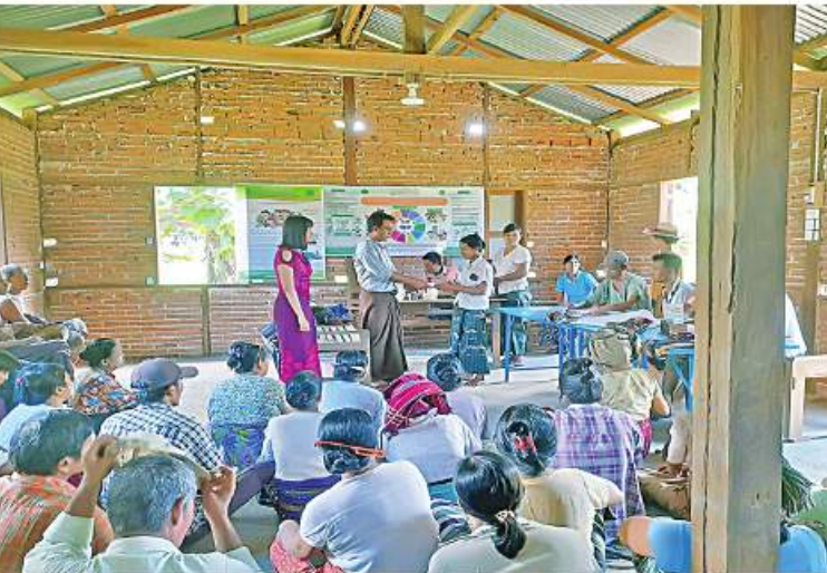
တောင်တွင်းကြီးမြို့နယ် ကျေးလက်ဒေသ ဦးခုတ်မွန်းလျန်က ပြောပြ၍ သိရသည်။ ဖွံ့ဖြိုးတိုးတက်ရေးဦးစီးဌာန မြို့နယ်ဦးစီးမှူး

စီမံကိန်းတာဝန်ခံခေ့ထမ်းများက မြစ်မီး ရောင်ကျေးရွာစီမံကိန်းရန်ပုံငွေကြပ်မူ ကော်မတီဝင်များထံ စီမံကိန်းရန်ပုံငွေကျပ် သိန်း ၁၀၀ ကို လွှဲပြောင်းပေးအပ်သည်။ ထို့နောက် စီမံကိန်းရန်ပုံငွေကြပ်မူ ကော်မတီဝင်များက ကန်လှကန်ကျေးရွာရှိ ဆီထွက်သီးနှံနေကြာ စိုက်ပျိုးရေးလုပ်ငန်း လုပ်ကိုင်မည့် အသင်းသား၊ အသင်းသူ ဦးရေ ၄၀ ကို မြစ်မီးရောင်ကျေးရွာစီမံကိန်း အရင်းမပျောက် လည်ပတ်ရန်ပုံငွေကျပ် သိန်း ၁၀၀ ထုတ်ချေးပေးခဲ့ကြောင်း