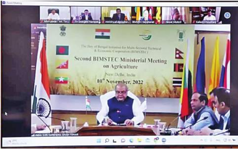
နေပြည်တော် နိုဝင်ဘာ ၁၀