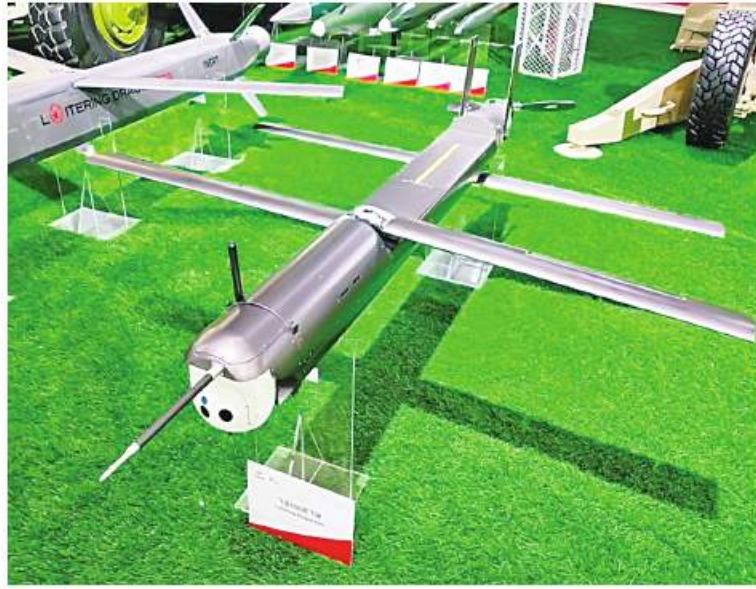
တရုတ်ကာကွယ်ရေး စက်မှုလုပ်ငန်း လေကြောင်းပြပွဲ ၂၀၂၂ ခုနှစ် (Air Show China 2022) တွင် ထုတ်ဖော်ပြသခဲ့သည့် မောင်းသူမဲ့ဒရုန်းသစ် (Loitering Munition) ကို နိုဝင်ဘာ ၇ ရက်က ၎င်းဒရုန်းလက်နက်သည် ထောက်လှမ်း

ခြင်း၊ စောင့်ကြည့်ခြင်းနှင့် ကင်းထောက်ခြင်း (ISR) စသည့် ရည်မှန်းချက်တာဝန်များ ထမ်းဆောင်ရန်အပြင် မြေပြင်ပစ်မှတ်များကို တိုက်ခိုက်ဖျက်ဆီးရန်အတွက်လည်း အသုံးပြုနိုင်သည်။