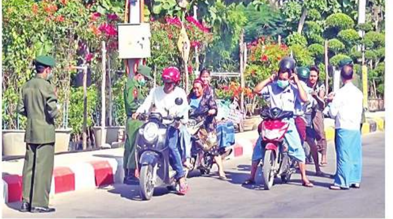
မန္တလေးတိုင်းဒေသကြီးအတွင်းရှိ မြို့နယ်များ၌ တာဝန်ရှိသူများက ဒေသခံပြည်သူများလက်ဝယ်အရောက် Mask များ အခမဲ့ပေးဝေလှူဒါန်းစဉ်။

တာဝန်ရှိသူများ၊ ဌာနဆိုင်ရာဝန်ထမ်းများ၊ ပရဟိတအဖွဲ့များနှင့် ပူးပေါင်း၍ ကိုဗစ်-၁၉ ရောဂါ ကာကွယ်ရေးအတွက် အသိပညာပေးဆောင်ရွက်ခြင်း၊ Mask များ တပ်ဆင်ပြီးသွားလာကြရန် လှုံ့ဆော်ခြင်းနှင့် Mask များကို ဒေသခံပြည်သူများ လက်ဝယ်အရောက် အခမဲ့ပေးဝေလှူဒါန်းခဲ့ကြကြောင်း သတင်းရရှိသည်။