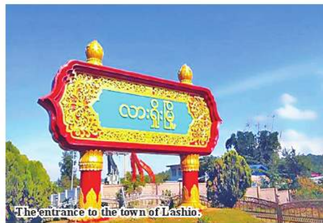
The entrance to the town of Lashio.

State set an aim to attract local and foreign tourists with preparing the natural resources such as waterfalls and landscapes, according to the Shan State hotelier association. ASH