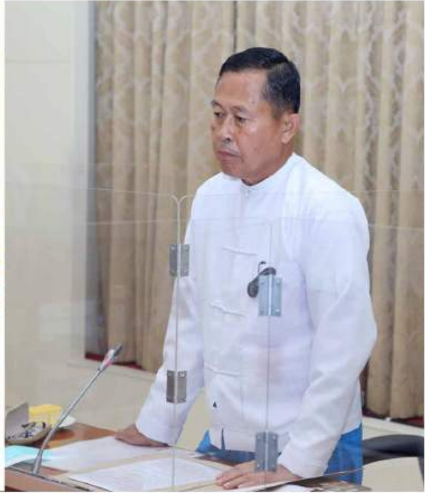
နိုင်ငံတော်စီမံအုပ်ချုပ်ရေးကောင်စီဒုတိယဥက္ကဋ္ဌ ဒုတိယဝန်ကြီးချုပ် ဒုတိယဗိုလ်ချုပ်မှူးကြီးစိုးဝင်း၊ ရွေးကောက်ပွဲအတွက် မဲစာရင်းပြုစုရေးဆိုင်ရာအစည်းအဝေးတွင် အမှာစကားပြောကြားစဉ်။

နေပြည်တော် နိုဝင်ဘာ ၁၀ ရွေးကောက်ပွဲအတွက် မဲစာရင်းပြုစုရေးဆိုင်ရာ အစည်းအဝေးကို ယနေ့ မွန်းလွဲ ၂ နာရီတွင် နေပြည်တော်ရှိ နိုင်ငံတော်စီမံအုပ်ချုပ်ရေးကောင်စီ ဥက္ကဋ္ဌရုံးအစည်းအဝေးခန်းမ၌ကျင်းပရာ နိုင်ငံတော်စီမံအုပ်ချုပ်ရေးကောင်စီဒုတိယဥက္ကဋ္ဌ ဒုတိယဝန်ကြီးချုပ် ဒုတိယဗိုလ်ချုပ်မှူးကြီးစိုးဝင်း တက်ရောက်အမှာစကားပြောကြားသည်။