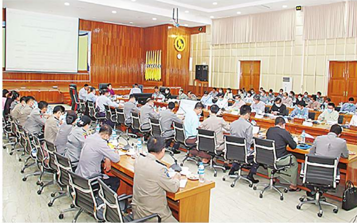
ငွေကြေးခဝါချမှုနှင့်အကြမ်းဖက်မှုကို ငွေကြေးထောက်ပံ့မှုတိုက်ဖျက်ရေးလုပ်ငန်း အဖွဲ့အစည်းအဝေး (၁/၂၀၂၂) ကျင်းပစဉ်

နေပြည်တော် နိုဝင်ဘာ ၁ ငွေကြေးခဝါချမှုနှင့် အကြမ်းဖက်မှုကို ငွေကြေးထောက်ပံ့မှု တိုက်ဖျက်ရေးလုပ်ငန်း အဖွဲ့အစည်းအဝေး (၁/၂၀၂၂) ကို ယနေ့ ပွန်းလွဲပိုင်းတွင် နေပြည်တော်ရှိ မြန်မာ