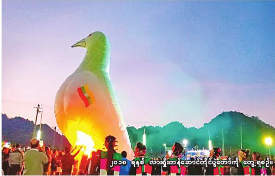
၂၀၁၈ ရန်ကင်း လားရှိုးတန်ဆောင်တိုင်ပွဲတော်ကို တွေ့ရစဉ်။