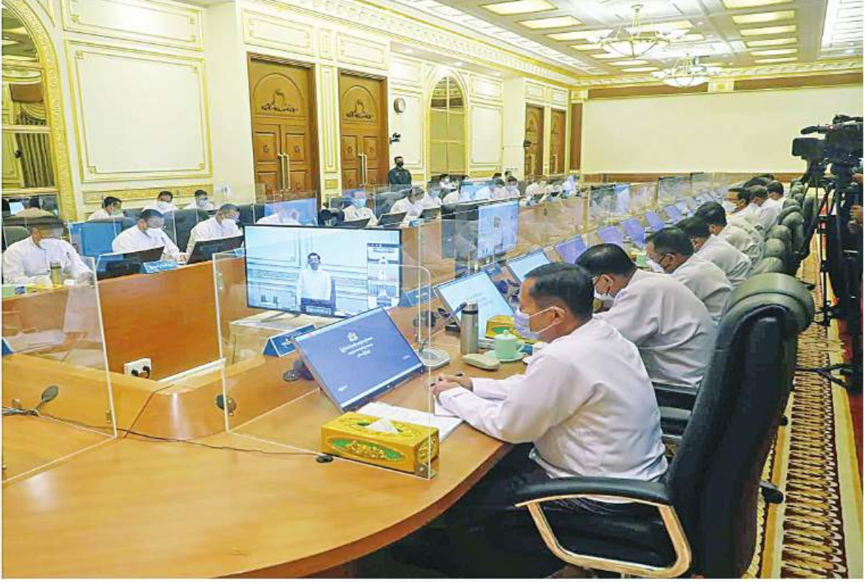
နိုင်ငံတော်စီမံအုပ်ချုပ်ရေးကောင်စီဥက္ကဋ္ဌ နိုင်ငံတော်ဝန်ကြီးချုပ် ပိုလ်ချုပ်မှူးကြီးမင်းအောင်လှိုင် ပြည်ထောင်စုအစိုးရအဖွဲ့အစည်းအဝေး အမှတ်စဉ်(၈/၂၀၂၂)တွင် အမှာစကားပြောကြားစဉ်။

နေပြည်တော် နိုဝင်ဘာ ၁ တော်စီမံအုပ်ချုပ်ရေးကောင်စီ ဥက္ကဋ္ဌ ပိုလ်ချုပ်မှူးကြီးမင်းအောင်လှိုင် တက်ရောက်အမှာစကားပြောကြားသည်။ ပြည်ထောင်စုအစိုးရအဖွဲ့ အစည်းအဝေးအမှတ်စဉ်(၈/၂၀၂၂)ကို ယနေ့ မွန်းလွဲပိုင်းတွင် နေပြည်တော်ရှိ နိုင်ငံတော်စီမံအုပ်ချုပ်ရေးကောင်စီဥက္ကဋ္ဌရုံး အစည်းအဝေးခန်းမ၌ ကျင်းပရာ နိုင်ငံတော်စီမံအုပ်ချုပ်ရေးကောင်စီ ဥတိယဥက္ကဋ္ဌ စိုးဝင်း၊ ပြည်ထောင်စုဝန်ကြီးများနှင့် နေပြည်တော်ကောင်စီဥက္ကဋ္ဌတို့ တက်ရောက်ကြပြီး တိုင်းဒေသကြီးနှင့် ပြည်နယ်ဝန်ကြီးချုပ်များက Video Conferencing ဖြင့် တက်ရောက်ကြသည်။ အုပ်ချုပ်မှုပိုင်းဆိုင်ရာလုပ်ငန်းများ၊ ပိုမိုထိရောက်လွယ်ကူစေရန်အတွက် ခရိုင်များထပ်မံတိုးချဲ့ဖွဲ့စည်းခဲ့ကြောင်း၊ ခရိုင်အဆင့်အနေဖြင့် အုပ်ချုပ်မှုပိုင်းဆိုင်ရာလုပ်ငန်းများကို စွမ်းဆောင်ရည်အရ စာမျက်နှာ ၁၆ ကော်လံ ၁။