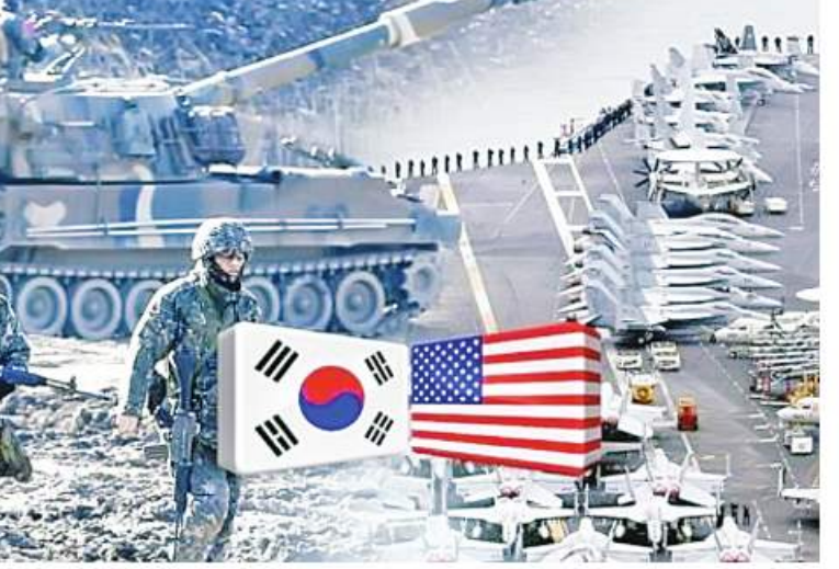
U.S. and South Korean warplanes begin largest ever air drills ကို အာသာပြန်ဆိုထားပါသည်။

မှုများကိုတန်ပြန်ရန် အဆိုပါပူးတွဲလေ့ကျင့်မှုမျိုးလိုအပ်ကြောင်း မဟာမိတ်များက ပြောကြားခဲ့သည်။ Vigilant Storm တွင် အမေရိကန်နှင့် တောင်ကိုရီးယားတို့က F-35 ကိုယ်ပျောက် တိုက်လေယာဉ်မျိုးကွဲများပါဝင်ပြီး အခြားလေယာဉ်များစွာ ပါဝင်လေ့ကျင့်ကြကြောင်း၊ ဩစတြေးလျနိုင်ငံက ၎င်းလေ့ကျင့်မှုအတွက် ဝေဟင်ဆီဖြည့်လေယာဉ်တစ်စင်းကိုလည်း ပြန်ကြက်အားဖြည့်ပေးထားမည်ဖြစ်ကြောင်း သိရသည်။ တောင်ကိုရီးယားနှင့်အမေရိကန်လေတပ်တို့သည် လေ့ကျင့်ရေးကာလအတွင်း တစ်ရက်လျှင် ၂၄ နာရီပတ်လုံးလေကြောင်းထောက်ပံ့မှု၊ ကာကွယ်ရေးတန်ပြန်လေကြောင်းပစ်ခတ်မှုနှင့်အရေးပေါ်လေကြောင်းစစ်ဆင်ရေးများကဲ့သို့သော အဓိကလေ