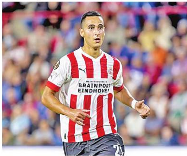
ပြောင်းလဲကစားရန် ဆုံးဖြတ်ခဲ့ခြင်း ဖြစ်သည်။ လက်ရှိတွင် မော်ရိုကိုအသင်းက ကမ္ဘာ့ဖလားပြိုင်ပွဲအတွက် ကစား သမားစာရင်း အတည်ပြုကြေညာ ခြင်းမရှိသေးဘဲ အယ်ဂါနီက နိုင်ငံ

သည် နယ်သာလန်နိုင်ငံတွင် မွေးဖွားသူတစ်ဦး ဖြစ်သော်လည်း ၎င်း၏မိဘများမှာ အာဖရိကနိုင်ငံ တစ်နိုင်ငံဖြစ်သည့် မော်ရိုကို နိုင်ငံသားများ ဖြစ်သည့်အတွက် နယ်သာလန်အသင်းနှင့် မော်ရိုကို အသင်းတို့တွင် ကိုယ်စားပြု ပါဝင် ကစားခွင့် ရရှိနေသူဖြစ်ကြောင်း သိရသည်။ လက်ရှိ ၂၀၂၂ ကမ္ဘာ့ဖလား ပြိုင်ပွဲတွင် နယ်သာလန်အသင်းနှင့် မော်ရိုကိုအသင်းတို့ အနေဖြင့် နှစ်သင်းစလုံး ဝင်ခွင့်ရရှိထားသည့် အသင်းများဖြစ်ပြီး နယ်သာလန် အသင်းနည်းပြ ဗန်ဂါးလ်က ၂၀၂၂ ကမ္ဘာ့ဖလားပြိုင်ပွဲအတွက် ပဏာမ ကစားသမား ၅၅ ဦးစာရင်းကို ရွေးချယ်ခဲ့ရာတွင် အယ်ဂါနီအနေ ဖြင့် ရွေးချယ်ခံရခြင်းမရှိသည့် အတွက် လက်ရွေးစင်အသင်း