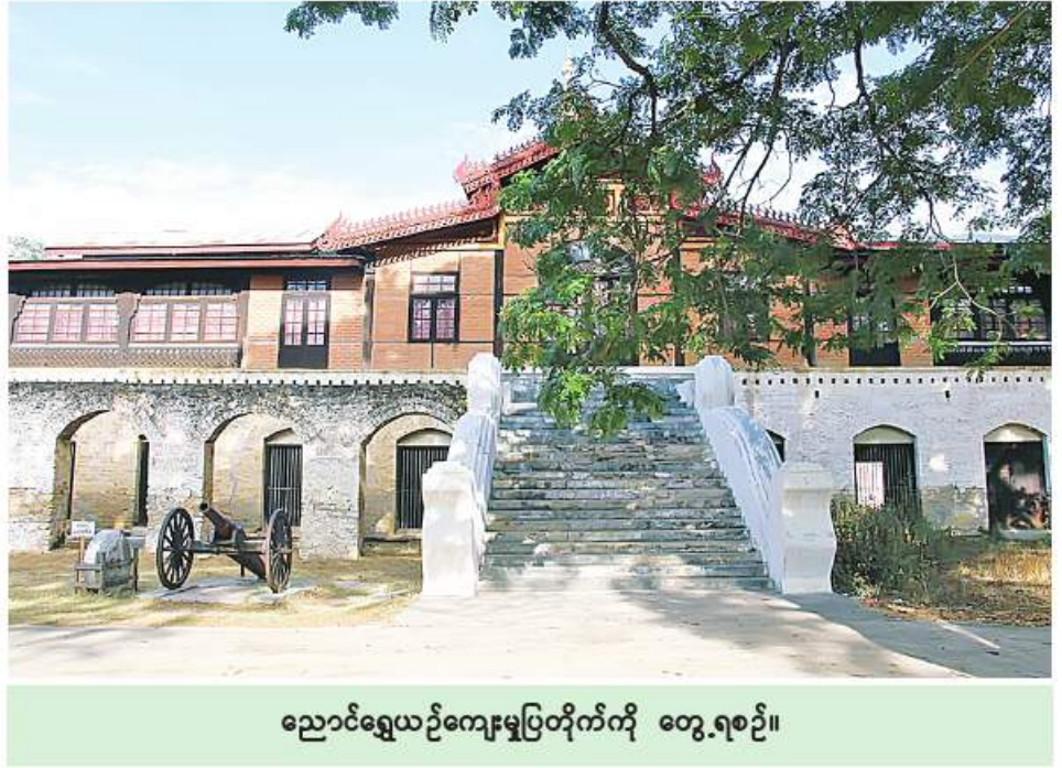
ညောင်ရွှေယဉ်ကျေးမှုပြတိုက်ကို တွေ့ရစဉ်။

ညောင်ရွှေဟော်ကို ညောင်ရွှေယဉ်ကျေးမှုပြတိုက်