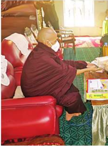
ဆရာတော်ထံ အလယ်ပိုင်းတိုင်းစစ်ဌာနချုပ် တောင်တွင်းကြီးတပ်နယ်မှ တာဝန်ရှိသူများက အမည်လေးမျိုး ဆက်ကပ်လှူဒါန်းခင်း။

အလားတူ အောက်တိုဘာ ၃၁ ရက်နှင့် ယနေ့တို့တွင် မွန်ပြည်နယ် သထုံမြို့ရှိ မင်္ဂလာအေးကမ္မဋ္ဌာန်းကျောင်းတိုက်၊ ကရင် ပြည်နယ် လှိုင်းဘွဲမြို့ရှိ မြို့မပရိယတ္တိ စာသင်တိုက်၊ ရန်ကုန်တိုင်းဒေသကြီး