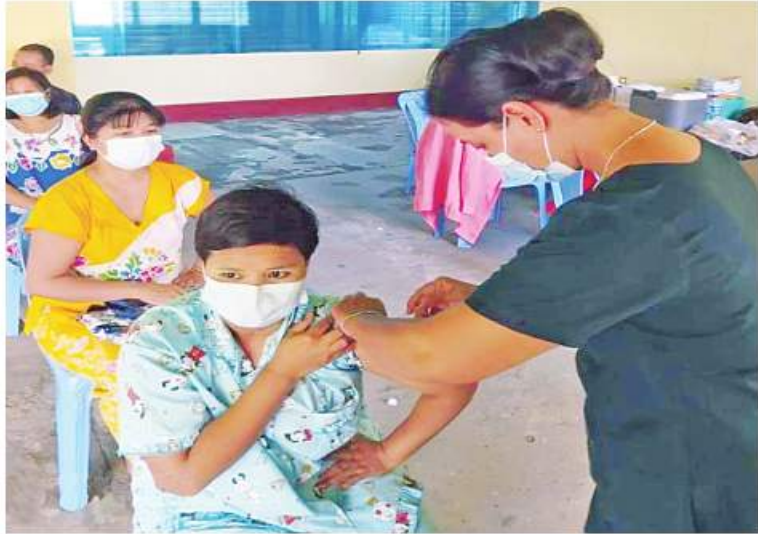
ရောဂါတိုင်းဒေသကြီး ဟင်္သာတမြို့၌ ဒေသခံပြည်သူများကို ကိုဗစ်-၁၉ ရောဂါကာကွယ်ဆေးထိုးနှံပေးစဉ်။

နေပြည်တော် နိုဝင်ဘာ ၁ ကိုဗစ်-၁၉ ရောဂါ ကာကွယ် ထိန်းချုပ် ကာကွယ်ဆေးထိုးနှံခြင်းသည် အဓိကအခန်းကဏ္ဍတွင် ပါဝင်သည့် လုပ်ငန်းတစ်ရပ်ဖြစ်သောကြောင့် တိုင်းဒေသကြီးနှင့် ပြည်နယ်အသီးသီးတွင် ကာကွယ်ဆေးထိုးနှံခြင်းကို အင်တိုက် အတွင်းရှိ ခရိုင် ခုနစ်ခုတို့မှ ဒေသခံပြည်သူ အားတိုက်ဆောင်ရွက်လျက်ရှိရာ ယနေ့ တွင် ရန်ကုန်တိုင်းဒေသကြီး ရန်ကင်းမြို့ နယ်နှင့် တာမွေမြို့နယ်တို့၌ ဒေသခံပြည်သူ ဦးရေ ၁၂၀၊ ရောဂါတိုင်းဒေသကြီးအတွင်း ရှိ မြို့နယ် ၂၆ မြို့နယ်တို့၌ ဒေသခံပြည်သူ ဦးရေ ၄၂၃၀ နှင့် မန္တလေးတိုင်းဒေသကြီး အတွင်းရှိ ခရိုင် ခုနစ်ခုတို့မှ ဒေသခံပြည်သူ