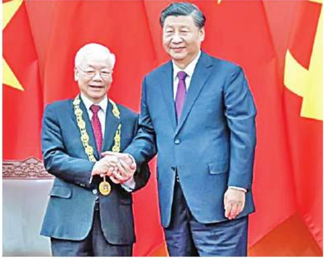
ပေကျင်း နိုဝင်ဘာ ၁ တရုတ်သမ္မတ ရှီကျင့်ဖျင်သည် ပေကျင်းမြို့သို့ ရောက်ရှိလာသည့် ပီယက်နမ်ကွန်မြူနစ်ပါတီ အကြီးအကဲ ငုယင်ဖုထွန်းကို အောက်တိုဘာ ၃၁ ရက်တွင် ပြည်သူ့မဟာ ခန်းမဆောင်၌ ကြိုဆိုတွေ့ဆုံခဲ့ ကြောင်း ရိုက်တာသတင်းဌာနက ဖော်ပြခဲ့သည်။

ဖြင့် မိမိတို့၏ ဖွံ့ဖြိုးမှုလုပ်ငန်းစဉ် များနှင့်ပတ်သက်၍ မည်သူ့ကိုမျှ ကြားဝင်စွက်ဖက်ခွင့် မပြုသင့် ကြောင်း ပီယက်နမ်ကွန်မြူနစ်ပါတီ အကြီးအကဲနှင့် တွေ့ဆုံစဉ် သမ္မတ ရှီကျင့်ဖျင်က တိုက်တွန်းခဲ့ကြောင်း သိရသည်။ တရုတ်နိုင်ငံနှင့် အနောက် အုပ်စုတို့ကြား အထူးသဖြင့် တရုတ် (တိုင်ပေ)ပြဿနာနှင့်ပတ်သက်၍ ကြားဆက်ဆံရေး တင်းမာနေစဉ် ပြည်ပကြားဝင်စွက်ဖက်မှုများ လက် မခံရန် တရုတ်သမ္မတက ပီယက်နမ် ကွန်မြူနစ်ပါတီ အကြီးအကဲကို တိုက်တွန်းခဲ့ခြင်းဖြစ်သည်။ ပြည်သူ့မဟာ ခန်းမဆောင်၌ ကျင်းပခဲ့သည့်ကြိုဆိုခွတ်ဆက်ပွဲ၌ ထူးခြားချက်အဖြစ် တရုတ်သမ္မတ ရှီကျင့်ဖျင်နှင့် ပီယက်နမ်ကွန်မြူနစ် ပါတီအကြီးအကဲ ငုယင်ဖုထွန်းတို့ နှစ်ဦးစလုံးမှာ လက်ဆွဲနှုတ်ဆက်မှု လည်း ပြုလုပ်ခဲ့ကြသည်။ ပီယက်နမ် ကွန်မြူနစ်ပါတီ အကြီးအကဲ ငုယင်ဖုထွန်း၏ တရုတ်ခရီးစဉ်သည် သမ္မတရာထူး ကို တတိယအကြိမ်မြောက်အဖြစ် သမ္မတရှီကျင့်ဖျင်ရယူပြီးနောက်ပိုင်း ပြည်ပခေါင်းဆောင်တစ်ဦး၏ပထမ ဆုံးတရုတ်ခရီးစဉ်ဖြစ်သည်။ တရုတ်နှင့် ပီယက်နမ်တို့သည် ကွန်မြူနစ်စနစ် ကျင့်သုံးသည့် နောက်ဆုံးကမ္ဘာ့နိုင်ငံ ငါးနိုင်ငံထဲ တွင်အပါအဝင်ဖြစ်ပြီး ကျန်သုံးနိုင်ငံ မှာ လာအို၊ ကမ္ဘောဒီးနှင့် မြောက် ကိုရီးယားတို့ ဖြစ်ကြောင်း သိရသည်။