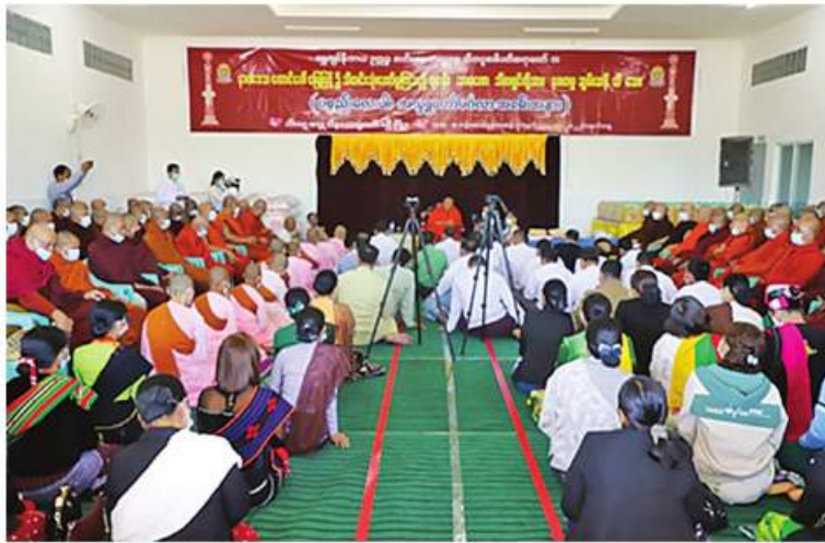
စစ်ကိုင်းတိုင်းဒေသကြီး ခန္တီးမြို့နယ်နှင့်လေရိုးမြို့နယ်အတွင်းရှိ သံဃာတော်များနှင့် သာသနာ့နယ်ဝင်သီလရှင်များကို အမည်လေးမျိုးနှင့်နဝကမ္မအလှူငွေများ ဆက်ကပ်လှူဒါန်းပွဲကျင်းပခင်း။

နေပြည်တော် နိုဝင်ဘာ ၁ ကိုဗစ်-၁၉ ရောဂါ ကြိုတင်ကာကွယ် ရေးလုပ်ငန်းများ ဆောင်ရွက်နေသည့် ကာလအတွင်း ဆွမ်းကိစ္စရပ်များ အဆင် ပြေစေရန်ရည်ရွယ်၍ တပ်မတော်(ကြည်း၊ ရေ၊ လေ) အရာရှိ၊ စစ်သည်၊ အရာထမ်း၊ အမှုထမ်းများနှင့် စေတနာရှင်အလှူရှင် များက မြို့နယ်အသီးသီးရှိ ဘုန်းတော်ကြီး ကျောင်းများ၊ သာသနာ့နယ်ဝင်သီလရှင် ကျောင်းများ၊ ဘာသာရေးကျောင်းများနှင့် ဘိုးဘွားရိပ်သာများသို့ ဆွမ်းဆန်တော်၊ ဆီ၊ ဆား၊ ပဲ အမည်လေးမျိုးနှင့် လှူဖွယ် ပစ္စည်းများလှူဒါန်းခြင်း၊ နေ့ဆွမ်းများ ဆက်ကပ်လှူဒါန်းခြင်းနှင့် လိုအပ်သည့် ကျန်းမာရေးစစ်ဆေးကုသပေးခြင်းများကို ဆောင်ရွက်လျက်ရှိသည်။