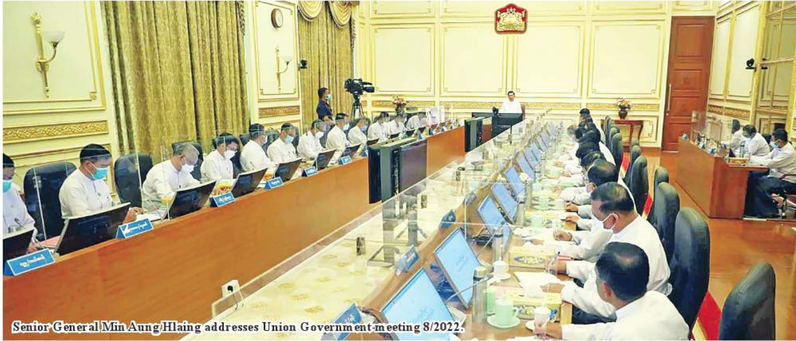
Senior General Min Aung Hlaing addresses Union Government meeting 8/2022.