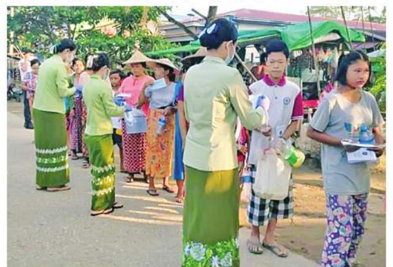
ရန်ကုန်တိုင်းဒေသကြီးအတွင်းရှိ မြို့နယ်များ၌ တာဝန်ရှိသူများက ဒေသခံ ပြည်သူများ လက်ဝယ်အရောက် Mask များကို အခမဲ့ပေးဝေလျှော့ဒါန်းစဉ်။

ပေးဝေလျှော့ဒါန်းလျက်ရှိရာ ယနေ့တွင် ရန်ကုန်တိုင်းဒေသကြီးအတွင်းရှိ မြို့နယ် ၄၄ မြို့နယ်တို့၌ စာသင်ကျောင်းများ၊ ဈေးများ၊ လမ်းများ၊ မြို့အဝင်ဝိတ်များနှင့် လူစည်ကားရာနေရာများတွင် နယ်မြေခံ တပ်မတော်သားများက ခရိုင်၊ မြို့နယ်စီမံ အုပ်ချုပ်ရေးအဖွဲ့မှ တာဝန်ရှိသူများ၊ ဌာန ဆိုင်ရာဝန်ထမ်းများ၊ ပရဟိတအဖွဲ့များနှင့် ပူးပေါင်း၍ ကိုဗစ်-၁၉ ရောဂါ ကာကွယ်ရေး အတွက် အသိပညာပေးဆောင်ရွက်ခြင်း၊ Mask များ တပ်ဆင်ပြီးသွားလာကြရန် လှုံ့ဆော်ခြင်းနှင့် Mask များကို ဒေသခံ ပြည်သူများ လက်ဝယ်အရောက်အခမဲ့ပေးဝေ လျှော့ဒါန်းခဲ့ကြောင်း သတင်းရရှိသည်။