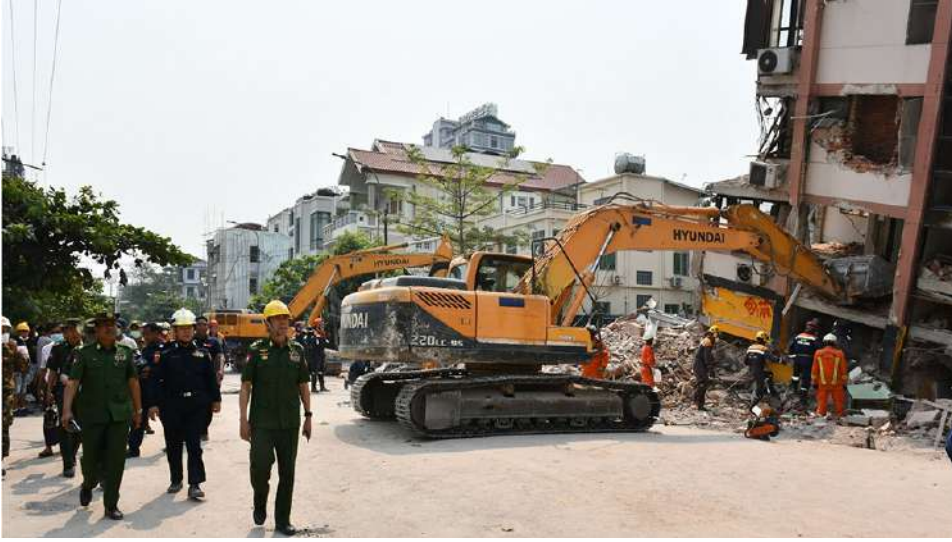
ကာကွယ်ရေးဦးစီးချုပ်ရုံး(ကြည်း)မှ ဒုတိယဗိုလ်ချုပ်ကြီးမျိုးမိုးအောင် လူနေအဆောက်အအုံများတွင် နိုင်ငံတကာကူညီကယ်ဆယ်ရေးအဖွဲ့များနှင့်ပူးပေါင်း၍ ကူညီကယ်ဆယ်ရေးလုပ်ငန်းများ ဆောင်ရွက်နေမှုကို ကြည့်ရှုအားပေးစဉ်။