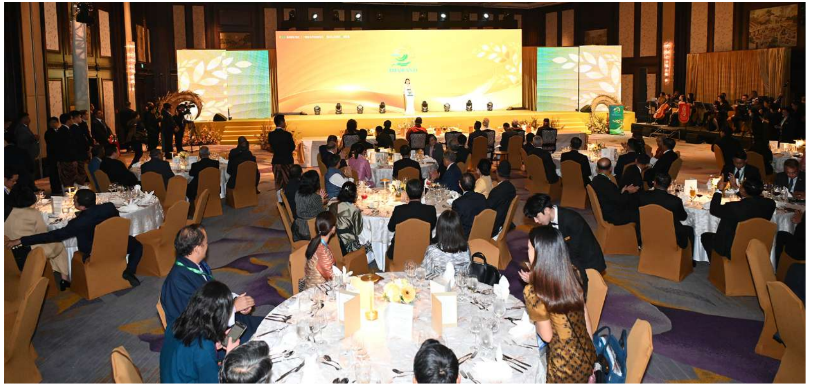
ဘင်းမိစတက်အလှည့်ကျဥက္ကဋ္ဌ ထိုင်းနိုင်ငံဝန်ကြီးချုပ် H.E. Ms. Paetongtarm Shinawatra က တည်ခင်းဧည့်ခံသည့် ကြိုဆိုဂုဏ်ပြုညစာစားပွဲကျင်းပစဉ်။

၂၆ ရှေ့ဖိုးမှအဆက် ထို့နောက် နိုင်ငံတော်စီမံအုပ်ချုပ်ရေး ကောင်စီဥက္ကဋ္ဌ နိုင်ငံတော်ဝန်ကြီးချုပ်သည် ဘင်းမိစတက်အလှည့်ကျဥက္ကဋ္ဌ ထိုင်းနိုင်ငံ ဝန်ကြီးချုပ်နှင့် ဘင်းမိစတက်အဖွဲ့ဝင်နိုင်ငံ များမှ နိုင်ငံခေါင်းဆောင်များနှင့်အတူ ကြိုဆို ဂုဏ်ပြုညစာကို အတူတကွသုံးဆောင်ခဲ့ ကြသည်။ အဆိုပါကြိုဆိုဂုဏ်ပြုညစာစားပွဲအခမ်း အနားသို့ ဘင်းမိစတက်အဖွဲ့ဝင်နိုင်ငံ အကြီး အကဲများဖြစ်ကြသည့် ဘင်္ဂလားဒေ့ရှ်နိုင်ငံ အကြံပေးပုဂ္ဂိုလ်ချုပ် Dr. Muhammad Yunus၊ ဘူတန်နိုင်ငံဝန်ကြီးချုပ် H. E. Mr. Tshering Tobgay၊ အိန္ဒိယနိုင်ငံ ဝန်ကြီးချုပ် H.E. Mr. Shri Narendra Modi၊ နီပေါနိုင်ငံ ဝန်ကြီးချုပ် H. E. Mr. K P Sharma Oli၊ သီရိလင်္ကာနိုင်ငံဝန်ကြီးချုပ် H.E. Dr. Ha-rini Amarasuriya နှင့် ဘင်းမိစတက်အဖွဲ့ဝင် နိုင်ငံများမှ ကိုယ်စားလှယ်အဖွဲ့ဝင်များ တက်ရောက်ခဲ့ကြကြောင်း သတင်း ရရှိသည်။ (၅၀၁)