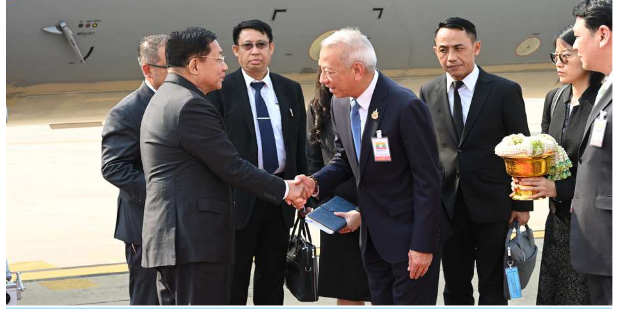
နိုင်ငံတော်စီမံအုပ်ချုပ်ရေးကောင်စီဥက္ကဋ္ဌ နိုင်ငံတော်ဝန်ကြီးချုပ် ဗိုလ်ချုပ်မှူးကြီးမင်းအောင်လှိုင်အား ထိုင်းနိုင်ငံအလုပ်သမားဝန်ကြီး H.E.Mr.Phiphat Ratchakitprakani ထိုင်းနိုင်ငံဆိုင်ရာ မြန်မာနိုင်ငံသံအမတ်ကြီး ဦးဇော်ဇော်စိုးနှင့် တာဝန်ရှိသူများက ထိုင်းနိုင်ငံ ဒွန်မောင်းလေဆိပ်တွင် ကြိုဆိုနှုတ်ဆက်စဉ်။

နှင့် တာဝန်ရှိသူများက လေဆိပ်၌ပို့ဆောင် နှုတ်ဆက်ကြသည်။ နိုင်ငံတော်စီမံအုပ်ချုပ်ရေး ကောင်စီ ဥက္ကဋ္ဌ နိုင်ငံတော်ဝန်ကြီးချုပ်နှင့်အတူ ကောင်စီတွဲဖက်အတွင်းရေးမှူး ဗိုလ်ချုပ်ကြီး ရဲဝင်းဦး၊ ပြည်ထောင်စုဝန်ကြီးများဖြစ်ကြ သည့် ဦးသန်းဆွေ၊ ဗိုလ်ချုပ်ကြီးမိုးအောင်၊ ကာကွယ်ရေးဦးစီးချုပ်ရုံးမှ အဆင့်မြင့် တပ်မတော်အရာရှိကြီးများ၊ ဒုတိယဝန်ကြီး များ၊ စစ်ဘက်၊ နယ်ဘက်မှ တာဝန်ရှိသူများ ခရီးစဉ်တွင် လိုက်ပါသွားကြသည်။ ထို့နောက် နိုင်ငံတော်စီမံအုပ်ချုပ်ရေး ကောင်စီဥက္ကဋ္ဌ နိုင်ငံတော်ဝန်ကြီးချုပ် ဦးဆောင်သော မြန်မာအဆင့်မြင့်ကိုယ်စား လှယ်အဖွဲ့သည် ဒေသစံတော်ချိန် ညနေ ၃ နာရီ မိနစ် ၅၀ တွင် ထိုင်းနိုင်ငံဒွန်မောင်း လေဆိပ်(Wing-6)သို့ရောက်ရှိကြရာ ထိုင်း နိုင်ငံ အလုပ်သမားဝန်ကြီး H.E.Mr.Phiphat