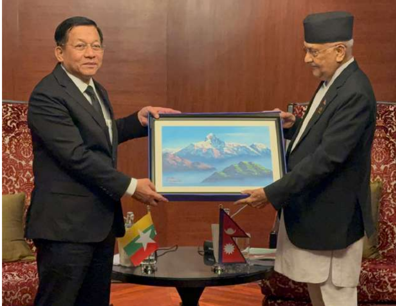
နိုင်ငံတော်စီမံအုပ်ချုပ်ရေးကောင်စီဥက္ကဋ္ဌ နိုင်ငံတော်ဝန်ကြီးချုပ် ဗိုလ်ချုပ်မှူးကြီးမင်းအောင်လှိုင်နှင့် နီပေါနိုင်ငံဝန်ကြီးချုပ် Rt.Hon.Mr.K P Sharma Oli တို့ အမှတ်တရလက်ဆောင်ပစ္စည်းများ အပြန်အလှန်ပေးအပ်စဉ်။