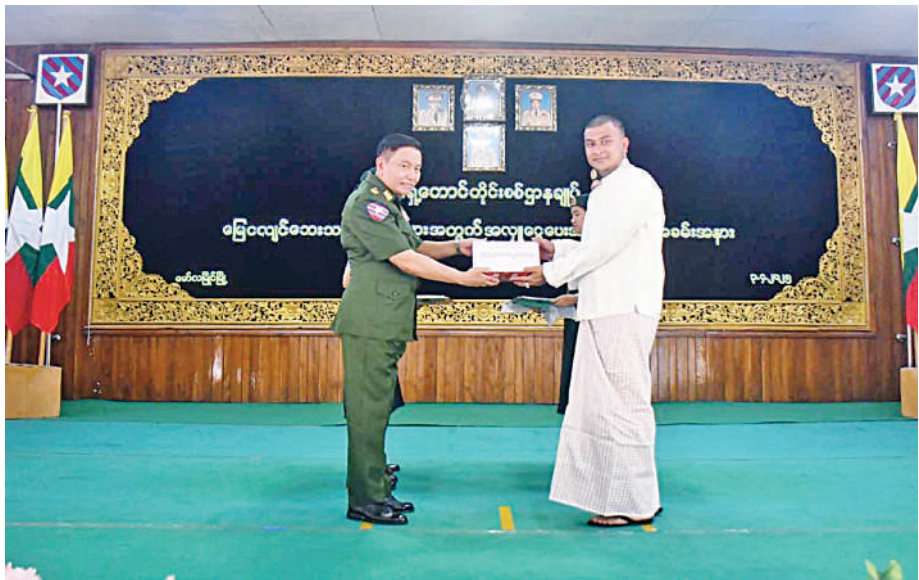
အရှေ့တောင်တိုင်းစစ်ဌာနချုပ် တိုင်းမှူး ဗိုလ်ချုပ် ကျော်လင်းမောင်ထံ အလှူရှင် တစ်ဦးက အလှူငွေများ ပေးအပ်လှူဒါန်းစဉ်။

နေပြည်တော် ဧပြီ ၃ ငလျင်ဒဏ်ခံသင့် ဒေသများအတွက် ကူညီကယ်ဆယ်ရေးနှင့် ပြန်လည်ထူထောင်ရေးလုပ်ငန်းများ ဆောင်ရွက်ရန်အတွက် အလှူရှင်များက အလှူငွေများ ပေးအပ်လှူဒါန်းခြင်းကို ယနေ့မွန်းလွဲပိုင်းတွင် အရှေ့တောင်တိုင်းစစ်ဌာနချုပ် အောင်ဆန်းခန်းမ၌ပြုလုပ်ရာ တိုင်းမှူးနှင့် အရာရှိ စစ်သည်၊ မိသားစုများက အလှူငွေကျပ် ၃၈၃၈ သိန်းကျော်ကို ပေးအပ်စစ်သည်၊ မိသားစုများ၊ စေတနာရှင်၊ လှူဒါန်းကြရာ တိုင်းမှူးနှင့် တာဝန်ရှိသူများက လက်ခံရယူကြပြီး ဂုဏ်ပြုမှတ်တမ်းလွှာများ ပြန်လည်ပေးအပ်ခဲ့ကြောင်း သတင်းရရှိသည်။ (၅၀၁)