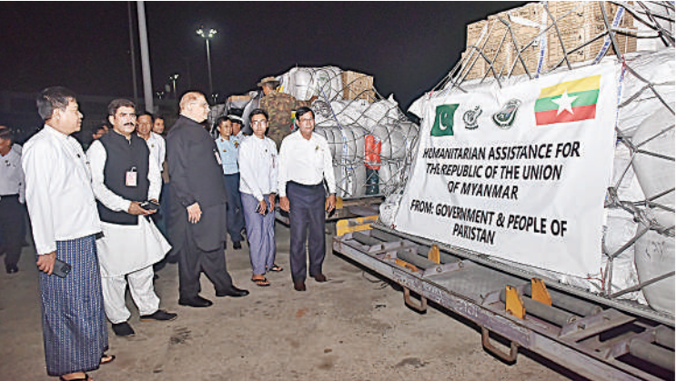
ပါကစ္စတန်နိုင်ငံမှ လူသားချင်းစာနာထောက်ထားမှုဆိုင်ရာ ကူညီကယ်ဆယ်ရေး ပစ္စည်းများနှင့် ဆေးဝါးများ ရောက်ရှိစဉ်။

ဦးစိုးသိန်းနှင့် တိုင်းဒေသကြီးဝန်ကြီး များ၊ မင်္ဂလာဒုံလေတပ်စခန်းဌာနချုပ် ဗိုလ်မှူးချုပ်စောဆန်နီနှင့် တပ်မတော် အရာရှိကြီးများ၊ မြန်မာနိုင်ငံဆိုင်ရာ ပါကစ္စတန်သံအမတ်ကြီး H.E. Mr. Imran Haider နှင့် သံရုံးတာဝန်ရှိသူများ၊ နိုင်ငံခြား ရေးဝန်ကြီးဌာနနှင့် လူမှုဝန်ထမ်း၊ ကယ်ဆယ်ရေးနှင့် ပြန်လည်နေရာချထား ရေးဝန်ကြီးဌာနတို့မှ တာဝန်ရှိသူများက ကြိုဆိုနှုတ်ဆက်၍ လိုအပ်သည်များ ပေါင်းစပ်ညှိနှိုင်းဆောင်ရွက်ပေးသည်။ အဆိုပါရောက်ရှိလာသည့် ကယ်ဆယ် ရေးပစ္စည်းများကို တပ်မတော်သားများ၊ ရန်ကုန်မြို့တော် စည်ပင်သာယာရေး ကော်မတီမှ ဝန်ထမ်းများ၊ ပြည်တွင်း ကုန်တင်ကုန်ချလုပ်သားများက သက်ဆိုင် ရာမော်တော်ယာဉ်များပေါ်သို့ တင်ဆောင် ပေးပြီး ငလျင်ဒဏ်သင့်ဒေသများသို့ ဖြန့်ဝေရန် နေပြည်တော်သို့ ဆက်လက် ပို့ဆောင်ပေးခဲ့ကြောင်း သတင်း ရရှိသည်။ (၅၀၁)