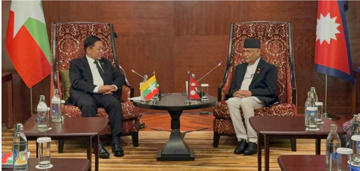
နိုင်ငံတော်စီမံအုပ်ချုပ်ရေးကောင်စီဥက္ကဋ္ဌ နိုင်ငံတော်ဝန်ကြီးချုပ် ဗိုလ်ချုပ်မှူးကြီးမင်းအောင်လှိုင်နှင့် နီပေါနိုင်ငံဝန်ကြီးချုပ် Rt.Hon. Mr.K P Sharma Oli တို့ တွေ့ဆုံဆွေးနွေးစဉ်။

နေပြည်တော် ဧပြီ ၃ ထိုင်းနိုင်ငံတွင် အိမ်ရှင်အဖြစ်လက်ခံကျင်းပမည့် BIMSTEC အစည်းအဝေးသို့ တက်ရောက်ရန်ရောက်ရှိနေသော နိုင်ငံတော်စီမံအုပ်ချုပ်ရေးကောင်စီဥက္ကဋ္ဌ နိုင်ငံတော်ဝန်ကြီးချုပ် ဗိုလ်ချုပ်မှူးကြီးမင်းအောင်လှိုင်သည် နီပေါနိုင်ငံဝန်ကြီးချုပ် Rt. Hon. Mr. K P Sharma Oli နှင့် ယနေ့ဒေသစံတော်ချိန် ညနေပိုင်းတွင် ဗန်ကောက်မြို့ရှိ ShangriLa ဟိုတယ်၌ တွေ့ဆုံဆွေးနွေးသည်။