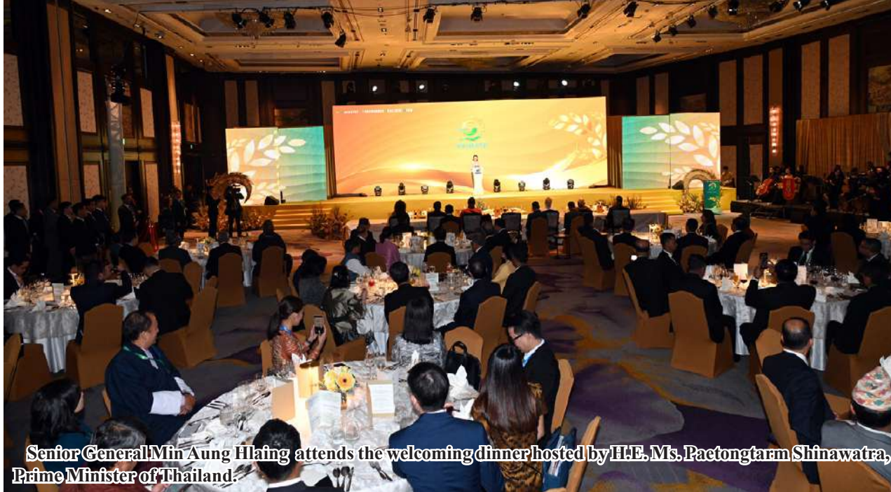
Senior General Min Aung Hlaing attends the welcoming dinner hosted by H.E. Ms. Paetongtarm Shinawatra, Prime Minister of Thailand.