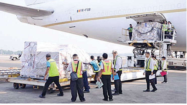
UNICEF Myanmar မှ ဖြန့်ဝေမည့် ကယ်ဆယ်ရေးသုံးပစ္စည်းများ ရောက်ရှိစဉ်။

၎င်းသည် မြန်မာနိုင်ငံရှိ မြေငလျင် ဒဏ်သင့်ဒေသများ၌ ကယ်ဆယ်ရေး လုပ်ငန်းများတွင် အသုံးပြုရန် UNICEF Myanmar မှ ဖြန့်ဝေမည့် ဆေးဝါးများ၊ လူသုံးကုန်ပစ္စည်းများနှင့် ကယ်ဆယ်ရေး ပစ္စည်းများ ၄၈၄ ပုံ၊ ၇၈၇၃၆ kg တင်ဆောင်၍ UAE နိုင်ငံ ဒူဘိုင်းမြို့ AI MAKTOWN လေဆိပ်မှ ရန်ကုန် လေဆိပ်သို့ ရောက်ရှိလာခြင်းဖြစ် ပြီး ရန်ကုန်လေဆိပ်သို့ ရောက်ရှိစဉ် UNICEF Myanmar မှ တာဝန်ရှိသူများက ကြိုဆိုလက်ခံပြီး Air Cargo Terminal သို့ သယ်ဆောင်၍ မြန်မာနိုင်ငံရှိ ငလျင် ဒဏ်သင့်ဒေသများသို့ ပို့ဆောင်ဖြန့်ဝေ သွားမည်ဖြစ်ကြောင်း သတင်း ရရှိသည်။ (၅၀၁)