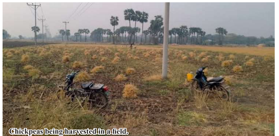
Chickpeas being harvested in a field.

tional intercropping option, ensuring a stable source of income. 206