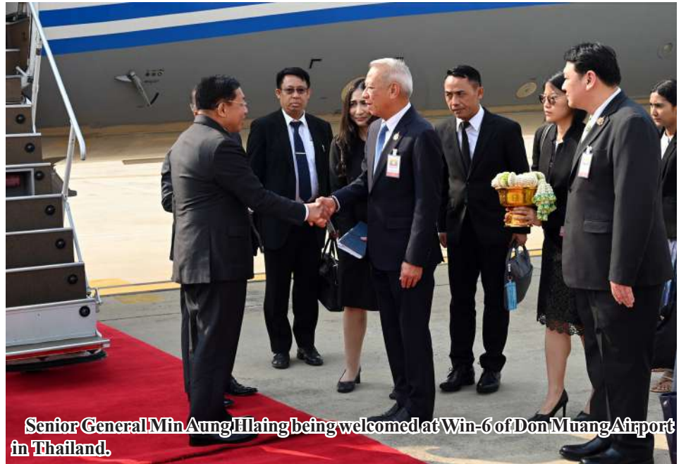
Senior General Min Aung Hlaing being welcomed at Win-6 of Don Muang Airport in Thailand.

Nay Pyi Taw April 3 A high-level Myanmar delegation led by Chairman of the State Administration Council Prime Minister Senior General Min Aung Hlaing left Nay Pyi Taw Tatmadaw Airport for Thailand at 2 pm this afternoon by special flight to attend the sixth BIM-