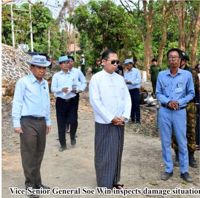
Vice-Senior General Soe Win inspects damage situation of a dam.