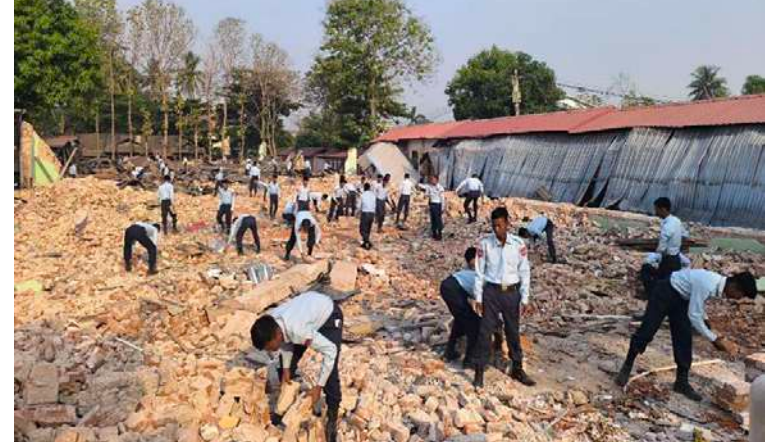
လျင်ဒဏ်သင့်ဒေသများ၌ နယ်မြေခံတပ်မတော်သားများနှင့် မြန်မာနိုင်ငံ ရဲတပ်ဖွဲ့ဝင်များက ကူညီကယ်ဆယ်ရေးလုပ်ငန်းများ ဆောင်ရွက်နေစဉ်။

သက်ဆိုင်ရာ တိုင်းစစ်ဌာနချုပ်များမှ တိုင်းမှူးများနှင့် တာဝန်ရှိသူများက လိုက်လံကြည့်ရှု၍ လိုအပ်သည်များ ညှိနှိုင်းဆောင်ရွက်ပေးပြီး လျင်ဒဏ် ကြောင့် ပြိုကျပျက်စီးခဲ့သည့် စေတီပုထိုး များ ပြုပြင်မွမ်းမံရန်အတွက် အလှူငွေများ ပေးအပ်လှူဒါန်းခြင်း၊ ထိခိုက်ဒဏ်ရာရရှိ၍ ဆေးရုံတက်ရောက်ကုသမှု ခံယူနေသူများ ကို သွားရောက်ကြည့်ရှုအားပေးခြင်းနှင့် သဘာဝဘေးဒဏ်ကြောင့် ယာယီကယ် ဆယ်ရေးစခန်းများတွင် နေထိုင်ကြသည့် ဒေသခံပြည်သူများအား ရင်းရင်းနှီးနှီး တွေ့ဆုံပြီး စားသောက်ဖွယ်ရာများ ပေးအပ်ခြင်းများကို ဆောင်ရွက်ခဲ့ ကြသည်။