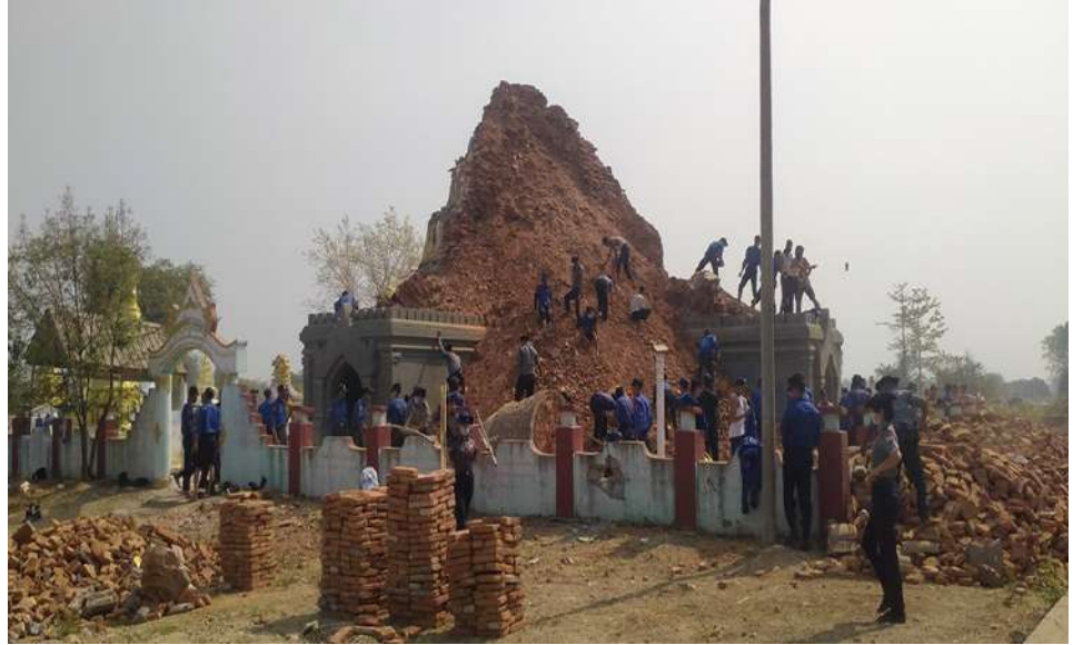
လျင်ဒဏ်သင့်ဒေသများ၌ နယ်မြေခံတပ်မတော်သားများနှင့် မြန်မာနိုင်ငံရဲတပ်ဖွဲ့ဝင်များက ကူညီကယ်ဆယ်ရေးလုပ်ငန်းများ ဆောင်ရွက်နေစဉ်။

နေပြည်တော် ဧပြီ ၃ ၂၀၂၅ ခုနှစ် မတ် ၂၈ ရက် အင်အား ပြင်းမြေ့လျင်လှုပ်ရှားမှုကြောင့် လမ်း တံတား၊ အဆောက်အအုံများ ထိခိုက် ပျက်စီးခဲ့ရသည့် နေရာများသို့ ကူညီ ကယ်ဆယ်ရေးလုပ်ငန်းများကို တိုင်းစစ် ဌာနချုပ်အသီးသီးမှ တပ်မတော်သားများ၊ မြန်မာနိုင်ငံရဲတပ်ဖွဲ့ဝင်များ၊ မီးသတ် တပ်ဖွဲ့ဝင်များ၊ ပြည်ပနိုင်ငံများမှ ကူညီ ကယ်ဆယ်ရေးအဖွဲ့များ၊ ဌာနဆိုင်ရာ ဝန်ထမ်းများ၊ လူမှုကူညီရေးအသင်း၊ အဖွဲ့များနှင့် ဒေသခံပြည်သူများပူးပေါင်း၍ အချိန်နှင့်တစ်ပြေးညီ ကူညီဆောင်ရွက်ပေး လျက်ရှိရာ ယနေ့တွင် ကာကွယ်ရေးဦးစီး ချုပ်ရုံး(ကြည်း)မှ ဒုတိယဗိုလ်ချုပ်ကြီး မျိုးမိုးအောင်၊ အလယ်ပိုင်းတိုင်းစစ်ဌာနချုပ် တိုင်းမှူး ဗိုလ်မှူးချုပ်ကျော်ကိုထိုက် နှင့် တာဝန်ရှိသူများသည် မန္တလေးမြို့ မဟာမုနိရုပ်ရှင်တော်၏ တန်ဆောင်းနေရာ များ၊ ရင်ပြင်တော်နေရာနှင့် ကျုံးမြို့ရိုး နေရာများတွင် ပြိုကျပျက်စီးမှုအား ရှင်းလင်းဆောင်ရွက်နေမှုများကိုလည်း ကောင်း၊ အောင်မြင်သစ်မြို့နယ်နှင့်