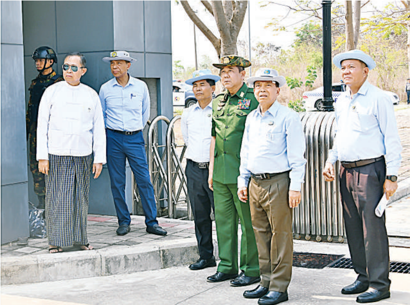
အမျိုးသားသဘာဝဘေးအန္တရာယ်ဆိုင်ရာစီမံခန့်ခွဲမှုကော်မတီဥက္ကဋ္ဌ နိုင်ငံတော်စီမံအုပ်ချုပ်ရေးကောင်စီ ဒုတိယဥက္ကဋ္ဌ ဒုတိယဝန်ကြီးချုပ် ဒုတိယဗိုလ်ချုပ်မှူးကြီးစိုးဝင်း ငလျင်ဘေးဒဏ်ကြောင့် ထိခိုက်ပျက်စီးခဲ့သည့် မြန်မာ့ဖွံ့ဖြိုးမှုအဖွဲ့အစည်းရုံး(MCI)အဆောက်အအုံကို ကြည့်ရှုစစ်ဆေးစဉ်။

နေပြည်တော် ဧပြီ ၃ ဗိုလ်ချုပ်မှူးကြီးစိုးဝင်းသည် ပြည်ထောင်စုဝန်ကြီး အမျိုးသားသဘာဝဘေးအန္တရာယ်ဆိုင်ရာ စီမံ များ၊ နေပြည်တော်ကောင်စီဥက္ကဋ္ဌ နေပြည်တော်တိုင်း ခန့်ခွဲမှုကော်မတီဥက္ကဋ္ဌ နိုင်ငံတော်စီမံအုပ်ချုပ်ရေး စစ်ဌာနချုပ် တိုင်းမှူးနှင့်အဖွဲ့ဝင်များလိုက်ပါ၍ ယနေ့ ကောင်စီ ဒုတိယဥက္ကဋ္ဌ ဒုတိယဝန်ကြီးချုပ် ဒုတိယ နေ့လယ်ပိုင်းတွင် နေပြည်တော်ကောင်စီနယ်မြေ အတွင်း ငလျင်ဘေးဒဏ်ကြောင့် ထိခိုက်ပျက်စီးမှုများ ဖြစ်ပေါ်ခဲ့သည့်အဆောက်အအုံများနှင့် နေပြည်တော် မှာကြားသည်။ ဦးစွာ နိုင်ငံတော်စီမံအုပ်ချုပ်ရေးကောင်စီ ရွက်လျက်ရှိသည့် ရေလွှဲဆည်နှင့်တံများကို လိုက်လံ ဒုတိယဥက္ကဋ္ဌ စာမျက်နှာ ၁၈ ကော်လံ ၁ ☆