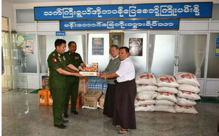
ကာကွယ်ရေးဦးစီးချုပ်ရုံး(ကြည်း)မှ ဒုတိယဗိုလ်ချုပ်ကြီးမျိုးမိုးအောင် မန်းတောင်ခြေ ဘိုးဘွားရိပ်သာအတွက် စားသောက်ဖွယ်ရာများ ပေးအပ်လှူဒါန်းစဉ်။

လျင်ဒဏ်ကြောင့် ပျက်စီးခဲ့သည့်နေရာ များ၌လည်းကောင်း ကူညီကယ်ဆယ်ရေး လုပ်ငန်းများ ဆောင်ရွက်ပေးပြီး ဒဏ်ရာ ရရှိကြသည့် ဒေသခံပြည်သူများအား ဆေးကုသရေးလုပ်ငန်းများ ဆောင်ရွက် ပေးကြသည်။ ယင်းသို့ ဆောင်ရွက်နေမှုများကို