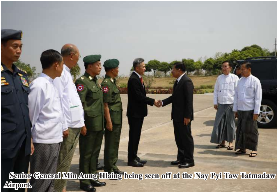
Senior General Min Aung Hlaing being seen off at the Nay Pyi Taw Tatmadaw Airport.