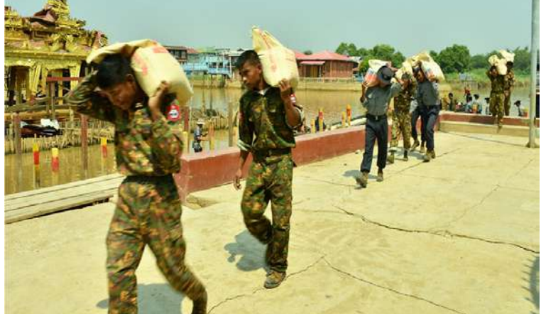
နယ်မြေခံတပ်မတော်သားများနှင့် မြန်မာနိုင်ငံရဲတပ်ဖွဲ့ဝင်များ ဖောင်တော်ဦး ဘုရားတွင် ကူညီကယ်ဆယ်ရေးလုပ်ငန်းများဆောင်ရွက်နေစဉ်။