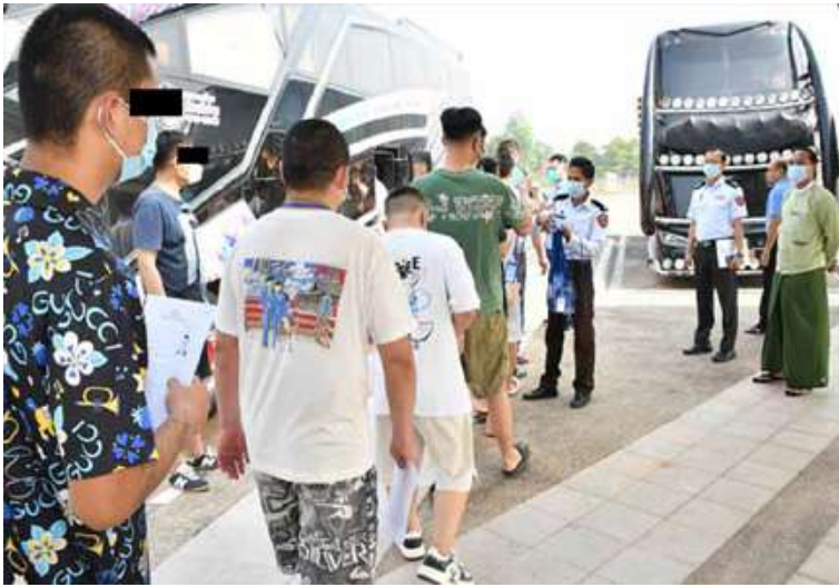
အွန်လိုင်းလိမ်လည်မှု (Telecom Fraud)နှင့် ဒုစရိုက်မှုလုပ်ငန်းများတွင် ဆက်စပ်ပါဝင်ခဲ့ကြသည့် တရုတ်နိုင်ငံသား ၃၇၈ ဦး မြန်မာ-ထိုင်း အမှတ်(၂)ချစ်ကြည်ရေးတံတားမှတစ်ဆင့် ထပ်မံလွှဲပြောင်းပေးအပ်ခဲ့မှု မှတ်တမ်းဓာတ်ပုံ။

နေပြည်တော် ဧပြီ ၃ - နိုင်ငံတော်အစိုးရအနေဖြင့် အွန်လိုင်း အသုံးပြု လိမ်လည်မှု(Online Scam)နှင့် အွန်လိုင်းလောင်းကစားမှု (Online Gambling) လုပ်ဆောင်နေသူများ၊ ပါဝင်ပတ်သက်သူများအားလုံးကို ပြတ်ပြတ်သားသား စုံစမ်းဖော်ထုတ်လျက်ရှိရာ မြန်မာနိုင်ငံအတွင်းသို့ နယ်စပ်လမ်းကြောင်းများမှ တရားမဝင် ဝင်ရောက်လာပြီး ကရင်ပြည်နယ် မြဝတီမြို့-ရွှေကုက္ကိုလ်နှင့် KK Park နယ်မြေများတွင် အွန်လိုင်းလောင်းကစားမှုများ၊ အွန်လိုင်းလိမ်လည်မှုများအပါအဝင် ဒုစရိုက်မှုများ ကျူးလွန်ခဲ့ကြသည့် တရုတ်နိုင်ငံသား ၃၇၈ ဦးကို ယနေ့တွင် မြန်မာ-ထိုင်း အမှတ်(၂)ချစ်ကြည်ရေးတံတားမှ တစ်ဆင့် သက်ဆိုင်ရာနိုင်ငံသို့ လူသားချင်းစာနာထောက်ထားမှုနှင့် နိုင်ငံအချင်းချင်း ချစ်ကြည်ရင်းနှီးမှုတို့ကို ရှေးရှု၍ ဥပဒေလုပ်ထုံးလုပ်နည်းများနှင့်အညီ ထပ်မံပြည်နှင့်လွှဲပြောင်းပေးသည်။ ဦးစွာ ကရင်ပြည်နယ် လူမှုရေးရာ