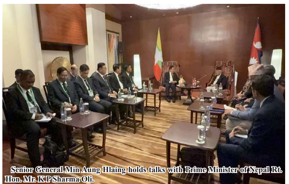
Senior General Min Aung Hlaing holds talks with Prime Minister of Nepal Rt. Hon. Mr. K P Sharma Oli.

between the two should be promoted. Tatmadaw sent relief aid to Nepal in time during the time it was struck by an earthquake and the gratitude goes to Nepal for providing help to Myanmar in time. As Nepal already has experience in restoration undertakings, the Senior General made a request to share its experience. Afterwards, views on further promotion of bilateral friendship and cooperation, enhancement of cooperation in multiple sectors including trade, investment and tourism, Myanmar's preparations to hold a free and fair multiparty democracy general election in the coming December, Myanmar and Nepal's outstanding cooperation on the interna-