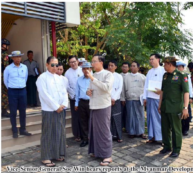
Vice-Senior General Soe Win hears reports at the Myanmar Development Institute (MDI).