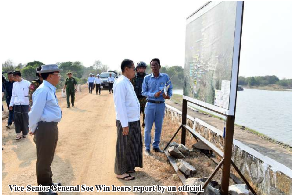
Vice-Senior General Soe Win hears report by an official.

The temporary hospital, operated by the Tatmadaw and the Ministry of Health, is staffed with specialists in surgery, obstetrics, pediatrics, orthopedics, ENT, anesthesiology, radiology, pathology, pharmacy, and public health, along with medical officers and nurses. Mobile operating theaters, X-ray vehicles, and necessary medical supplies are available to provide round-the-clock emergency care. As of today, 36 critical patients and 60 outpatients have received treatment. Additionally, a 40-member medical team sent by the King of Bhutan is collaborating with local teams, bringing essential medicines and equipment. The Bhutanese team is setting up a separate temporary hospital and will continue providing humanitarian medical care to earthquake victims. 100