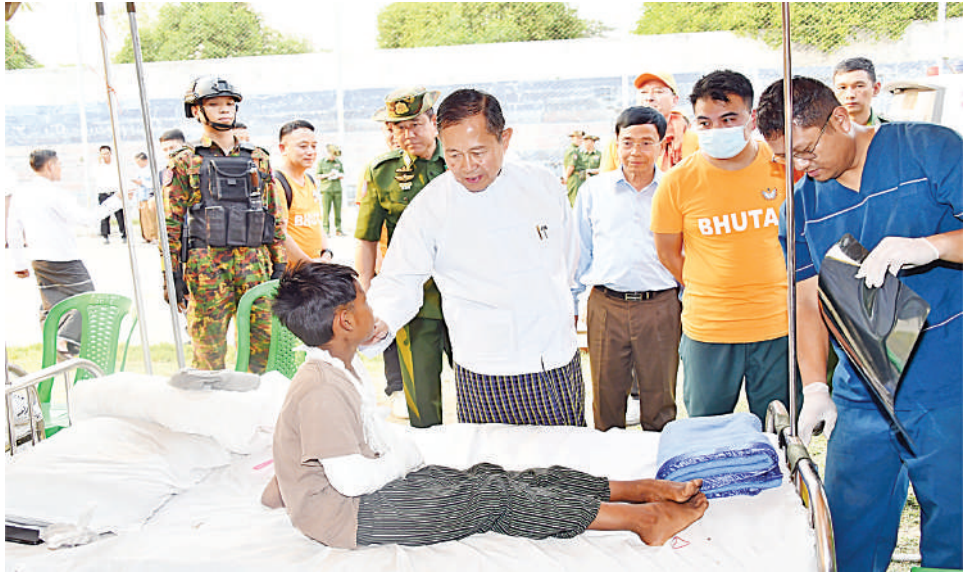
အမျိုးသားသဘာဝဘေးအန္တရာယ်ဆိုင်ရာစီမံခန့်ခွဲမှုကော်မတီဥက္ကဋ္ဌ နိုင်ငံတော်စီမံအုပ်ချုပ်ရေးကောင်စီဒုတိယဥက္ကဋ္ဌ ဒုတိယဝန်ကြီးချုပ် ဒုတိယဗိုလ်ချုပ်မှူးကြီးစိုးဝင်း ပျဉ်းမနားမြို့ ပေါင်းလောင်းအားကစားကွင်း၌ ဖွင့်လှစ်ထားရှိသည့် ယာယီဆေးရုံ(ပေါင်းလောင်း)၌ ငလျင်ဒဏ်ကြောင့် ထိခိုက်ဒဏ်ရာရရှိခဲ့သော အရပ်သားပြည်သူများကို တစ်ဦးချင်း ရင်းရင်းနှီးနှီးလိုက်လံအားပေးစကားပြောကြားစဉ်။

စာမျက်နှာ ၁၈ မှအဆက် အားပေးစကားပြောကြားသည်။ အဆိုပါ ယာယီဆေးရုံ(ပေါင်းလောင်း) ကို တပ်မတော်နှင့် ကျန်းမာရေးဝန်ကြီးဌာန တို့မှ ဆေးကုသမှုပံ့ပိုးမှု၊ ခွဲစိတ်ပေးရုံ၊ သားဖွား မီးယပ်ပေးရုံ၊ ကလေးပေးရုံ၊ အရိုးပေးရုံ၊ မျက်စိ၊ နား၊ နှာခေါင်း၊ လည်ချောင်းပေးရုံ မေ့ဆေးပေးရုံ၊ ရောဂါဗေဒနှင့် ဓာတ်မှန် ပေးရုံ၊ ဆေးဝါးဗေဒပေးရုံ၊ ပြည်သူ့ကျန်းမာရေးပေးရုံ၊ ဆေးမှူးများ၊ သူနာပြုအရာရှိ၊ စစ်သည်များနှင့်အတူ ရွေ့လျားခဲ့စိတ်ကုသ ယာဉ်၊ ရွေ့လျားဓာတ်မှန်ရိုက်ယာဉ်များ၊ လိုအပ်သော ဆေးဝါးပစ္စည်းကိရိယာတို့ ဖြင့် ငလျင်ဒဏ်ကြောင့် ထိခိုက်ဒဏ်ရာ ရရှိခဲ့သူများနှင့် အခြားလူနာများကို လိုအပ် သည့် ကျန်းမာရေးစောင့်ရှောက်မှုများ နေ့ညမပြတ် ကြပ်မတ်ကုသပေးလျက်ရှိ သည်။ ယနေ့အထိ အရေးကြီးလူနာ ၃၆ ဦး နှင့် ပြင်ပလူနာဦးရေ ၆၀ တို့ကို လိုအပ် သည့် ကျန်းမာရေးစောင့်ရှောက်မှုများ ဆောင်ရွက်ပေးလျက်ရှိသည်။ ထို့ပြင် အဆိုပါ ယာယီဆေးရုံ(ပေါင်းလောင်း)၌ ဘူတန်နိုင်ငံဘုရင်က စေလွှတ်ပေးသည့် ဘူတန်ဆေးကုသရေးအဖွဲ့ ဦးရေ ၄၀ က လည်း လိုအပ်သောဆေးဝါးပစ္စည်းများ နှင့်အတူ ပူးပေါင်းပါဝင်၍ လိုအပ်သည့် ဆေးကုသခြင်းများ ပူးပေါင်းဆောင်ရွက် ပေးလျက်ရှိပါသည်။ အဆိုပါဘူတန်ဆေးကုသ ရေးအဖွဲ့သည် သီးခြားယာယီဆေးရုံ တည်ဆောက်လျက်ရှိပြီး ငလျင်ဒဏ်သင့် လူနာများကို လူသားချင်းစာနာထောက် ထားမှုဖြင့် လိုအပ်သည့် ကျန်းမာရေး စောင့်ရှောက်မှုများကို ဆက်လက်ဆောင် ရွက်ပေးသွားမည်ဖြစ်ကြောင်း သတင်း ရရှိသည်။ (၅၀၁)