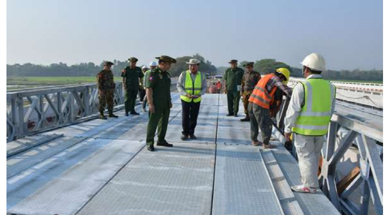
ကာကွယ်ရေးဦးစီးချုပ်ရုံး(ကြည်း)မှ ဒုတိယဗိုလ်ချုပ်ကြီးဖုန်းမြတ် လျင်ဒဏ် ကြောင့် ပျက်စီးခဲ့သော ဆွာချောင်းတံတား ပြန်လည်ပြုပြင်တည်ဆောက်နေမှုကို ကြည့်ရှုစစ်ဆေးစဉ်။