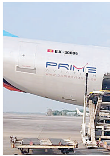
ကမ္ဘာ့ကျန်းမာရေးအဖွဲ့ (WHO) မှ လူသားချင်းစာနာထောက်ထားမှုဆိုင်ရာ အကူအညီ ကျန်းမာရေးအထောက်အကူပြုပစ္စည်းများနှင့် ဆေးဝါးများ ရောက်ရှိစဉ်။

နေပြည်တော် ဧပြီ ၃ နိုင်ငံတော်အစိုးရအနေဖြင့် ငလျင် ဒဏ်သင့်ဒေသများရှိ ပျက်စီးဆုံးရှုံးမှုများကို အလျင်အမြန်စုံစမ်းစစ်ဆေးပြီး အချိန်နှင့်တစ်ပြေးညီ ကူညီကယ်ဆယ်ရေး လုပ်ငန်းများ ဆောင်ရွက်လျက်ရှိသည့် အပြင် ပြည်ပမှ လူသားချင်းစာနာ ထောက်ထားမှုဆိုင်ရာ အကူအညီများကို လမ်းဖွင့်ပေးထားပြီးဖြစ်ရာ ယနေ့ညနေ ပိုင်းတွင် ကမ္ဘာ့ကျန်းမာရေးအဖွဲ့ (WHO) မှ မြန်မာနိုင်ငံရှိ ငလျင်ဒဏ်သင့်ပြည်သူများ အတွက် ပေးပို့လှူဒါန်းသည့် လူသားချင်း စာနာထောက်ထားမှုဆိုင်ရာ အကူအညီ ဆေးဝါးများ တင်ဆောင်လာသော Moalem Aviation လေကြောင်းလိုင်းမှ Cargo Flight (ကယ်ဆယ်ရေးပစ္စည်းတင်) လေယာဉ်သည် အိန္ဒိယနိုင်ငံ ကိုးကတ္တား လေဆိပ်မှ ရန်ကုန်အပြည်ပြည်ဆိုင်ရာ လေဆိပ်သို့ ရောက်ရှိကြသည်။