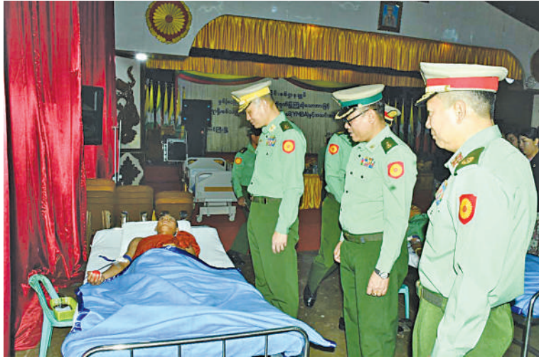
အရှေ့ပိုင်းတိုင်းစစ်ဌာနချုပ် တိုင်းမှူး ဗိုလ်ချုပ်ဇော်မင်းလတ် သွေးလှူရှင်များ သွေးလှူဒါန်းနေမှုကို ကြည့်ရှုအားပေးစဉ်။

နေပြည်တော် မတ် ၂၄ မတ် ၂၅ ရက်တွင် ကျရောက်မည့် နှစ် ၈၀ ပြည့် တပ်မတော်နေ့ကြိုဆို ဂုဏ်ပြုသောအားဖြင့် စုပေါင်းသွေးလှူဒါန်း ပွဲကို ယနေ့နံနက်ပိုင်းတွင် အရှေ့ပိုင်းတိုင်း