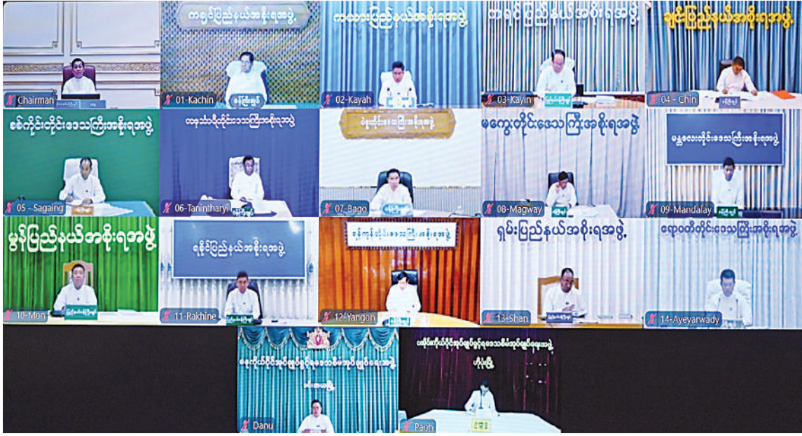
အမျိုးသားစီမံကိန်းကော်မရှင်အစည်းအဝေးသို့ တိုင်းဒေသကြီးနှင့် ပြည်နယ်ဝန်ကြီးချုပ်များ၊ ကိုယ်ပိုင်အုပ်ချုပ်ခွင့်ရဒေသ တိုင်းဦးစီးအဖွဲ့ဥက္ကဋ္ဌများက Video Conferencing ဖြင့် တက်ရောက်ကြစဉ်။

ရှင်းလင်းတင်ပြချက်များနှင့်စပ်လျဉ်း၍ အမျိုးသား စီမံကိန်းကော်မရှင်ဥက္ကဋ္ဌ နိုင်ငံတော်ဝန်ကြီးချုပ်က ဖြည့်စွက် ပြောကြားရာတွင် စီမံကိန်းဆိုသည်မှာ အမှန်တကယ်လုပ်နိုင်သည့် အရာကို စီမံကိန်းရေးဆွဲဆောင်ရွက်၍ အကောင် အထည်ဖော်ဆောင်ရွက်ခြင်းဖြစ်ကြောင်း၊ ပြည်သူများအတွက် အဓိကအကျိုး ဖြစ်ထွန်းစေမည့် စီမံကိန်းများကို ရေးဆွဲ ဆောင်ရွက်ကြရန်လိုကြောင်း၊ ပြည်တွင်း ကုန်ထုတ်လုပ်မှုများ တိုးတက်အောင်