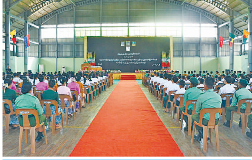
အရှေ့အလယ်ပိုင်းတိုင်းစစ်ဌာနချုပ်၌ နွေရာသီသင်တန်းများ ပေးအပ်စဉ်။