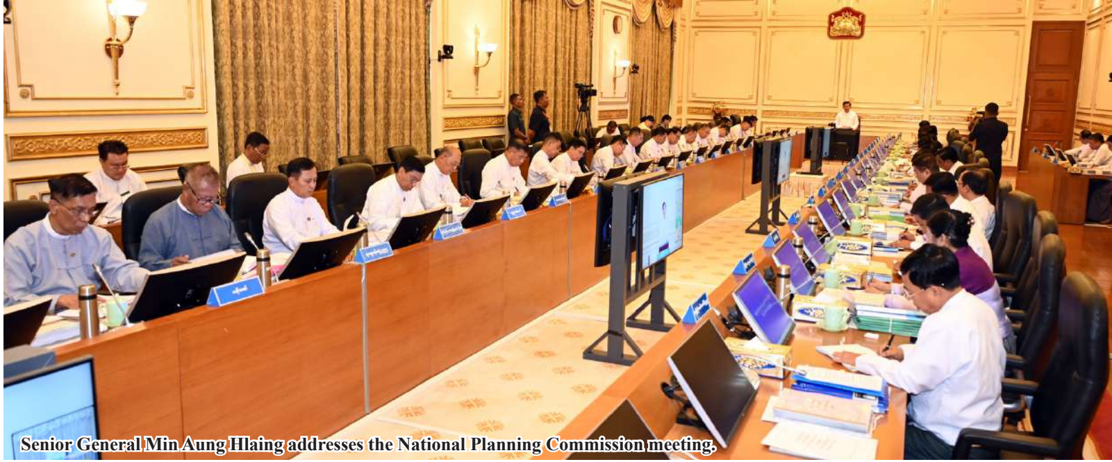
Senior General Min Aung Hlaing addresses the National Planning Commission meeting.