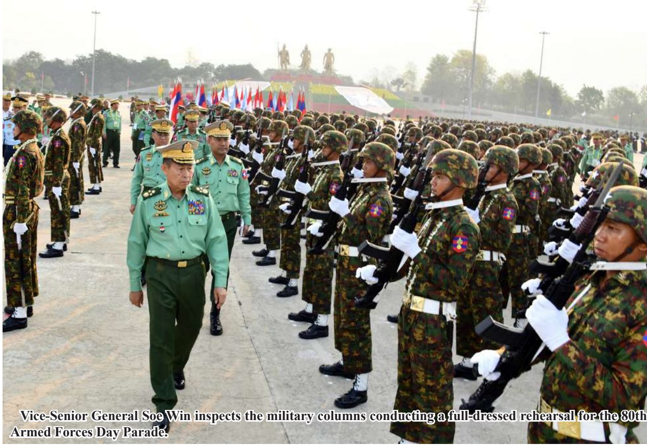
Vice-Senior General Soe Win inspects the military columns conducting a full-dressed rehearsal for the 80th Armed Forces Day Parade.

Nay Pyi Taw March 24 Military columns, which will take part in the parade for the 80th Anniversary of Armed Forces Day, which falls on 27 March 2025, conducted a full-dressed rehearsal at the Nay Pyi Taw Parade Ground this morning.