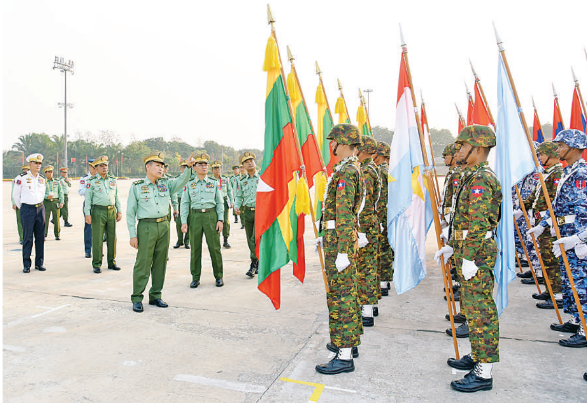
နိုင်ငံတော်စီမံအုပ်ချုပ်ရေးကောင်စီ ဒုတိယဥက္ကဋ္ဌ ဒုတိယတပ်မတော်ကာကွယ်ရေးဦးစီးချုပ် ကာကွယ်ရေးဦးစီးချုပ်(ကြည်း) ဒုတိယဗိုလ်ချုပ်မှူးကြီးစိုးဝင်း နှစ် ၈၀ ပြည့် တပ်မတော်နေ့စစ်ရေးပြအခမ်းအနား၌ ပါဝင်စစ်ရေးပြကြမည့် အလံတော်အဖွဲ့ကို ကြည့်ရှုစစ်ဆေးစဉ်။