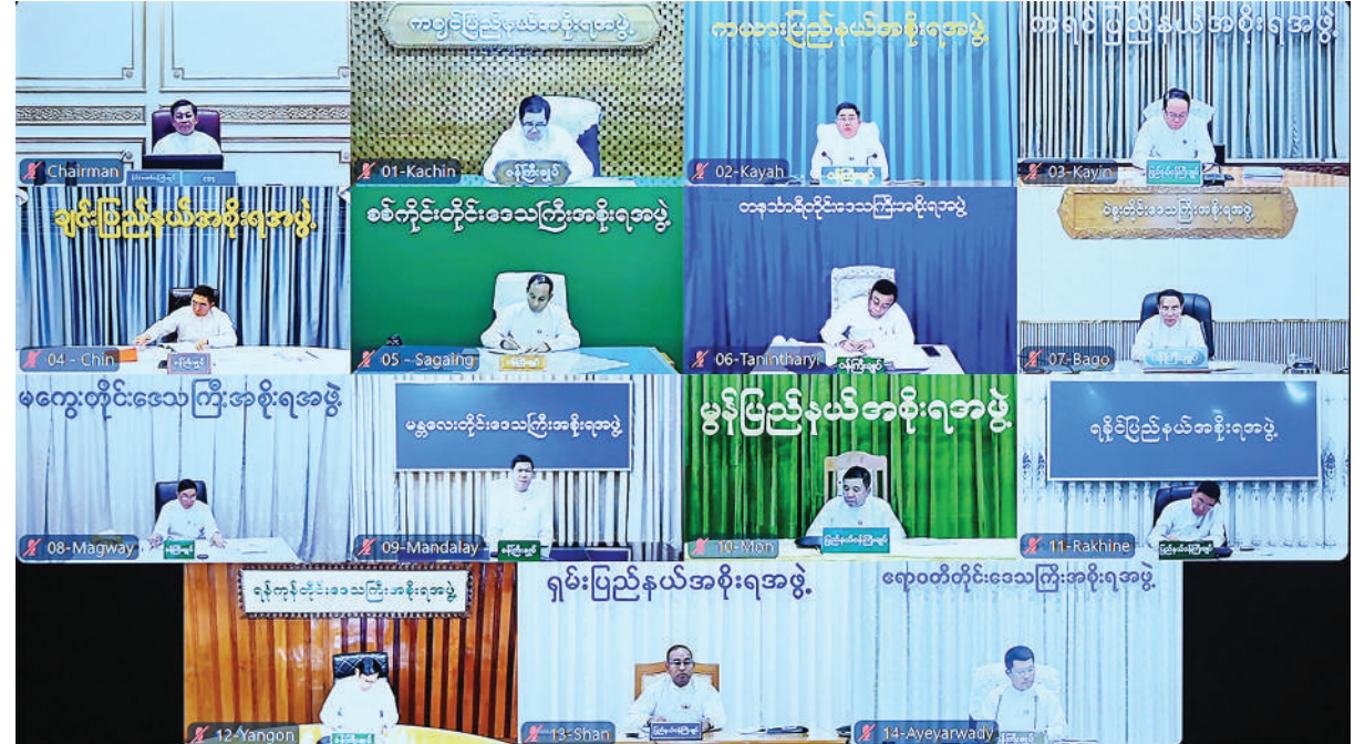
ဘဏ္ဍာရေးဆိုင်ရာကော်မရှင်အစည်းအဝေးသို့ တိုင်းဒေသကြီးနှင့် ပြည်နယ်ဝန်ကြီးချုပ်များက Video Conferencing ဖြင့် တက်ရောက်ကြစဉ်။

လျာထားငွေများအတိုင်း အပြည့်အဝ ကောက်ခံရရှိရေး၊ နှစ်ဟောင်းကြေးကျန်များ ပြန်လည်ရရှိရေး၊ အမှန်တကယ်ရရှိနိုင်မည့် ပြည်ပချေးငွေ၊ ပြည်ပအကူအညီရငွေများ ဖြစ်စေရေးအတွက် စိစစ်လျာထားမှုပြုလုပ်ခဲ့ကြောင်း။ ကြိုတင်မမျှော်မှန်းနိုင်သည့် သဘာဝဘေးအန္တရာယ်ကာကွယ်ရေး၊ ကယ်ဆယ်ရေးနှင့် ပြန်လည်ထူထောင်ရေး၊ နေရပ်စွန့်ခွာပြည်သူများ၏ စားဝတ်နေရေးနှင့် အုပ်ချုပ်မှုဆိုင်ရာကိစ္စများအတွက် အရေးပေါ်ရန်ပုံငွေကို ပြည်ထောင်စုတွင် ငွေကျပ်ဘီလီယံ ၂၀၀၊ နေပြည်တော်ကောင်စီအပါအဝင် တိုင်းဒေသကြီး၊ ပြည်နယ်များတွင် ငွေကျပ်တစ်ဘီလီယံစီဖြင့် ငွေကျပ် ၁၅ ဘီလီယံ စုစုပေါင်း ငွေကျပ် ၂၁၅ ဘီလီယံ ခွင့်ပြုထားကြောင်း၊ ပြည်နယ်များသို့