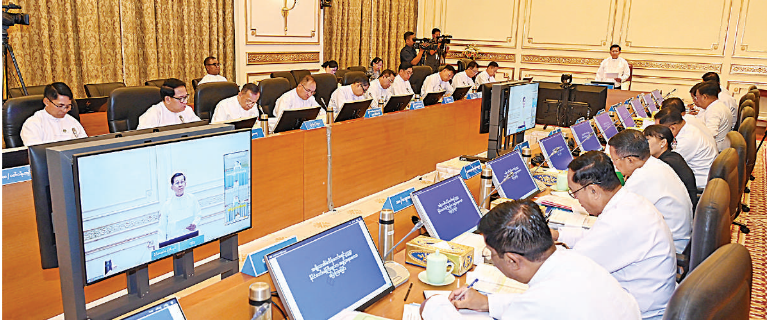
အမျိုးသားစီမံကိန်းကော်မရှင်ဥက္ကဋ္ဌ နိုင်ငံတော်စီမံအုပ်ချုပ်ရေးကောင်စီဥက္ကဋ္ဌ နိုင်ငံတော်ဝန်ကြီးချုပ် ဗိုလ်ချုပ်မှူးကြီးမင်းအောင်လှိုင် အမျိုးသားစီမံကိန်းကော်မရှင် အစည်းအဝေးတွင် အမှာစကားပြောကြားစဉ်။