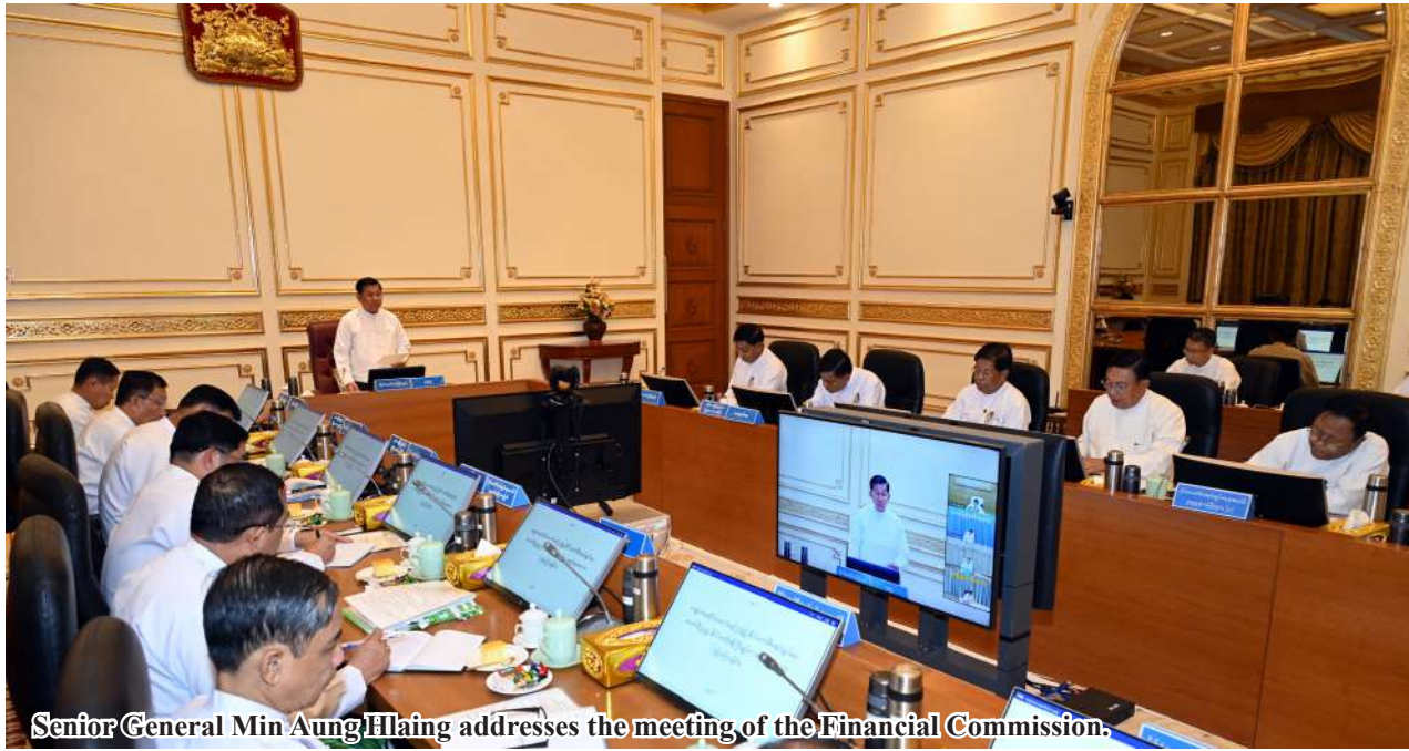
Senior General Min Aung Hlaing addresses the meeting of the Financial Commission.