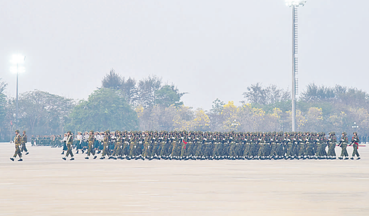
နိုင်ငံတော်စီမံအုပ်ချုပ်ရေးကောင်စီ ဒုတိယဥက္ကဋ္ဌ ဒုတိယတပ်မတော်ကာကွယ်ရေးဦးစီးချုပ် ကာကွယ်ရေးဦးစီးချုပ်(ကြည်း) ဒုတိယဗိုလ်ချုပ်မှူးကြီးစိုးဝင်း နှစ် ၈၀ ပြည့် တပ်မတော်နေ့စစ်ရေးပြအခမ်းအနား၌ ပါဝင်စစ်ရေးပြကြမည့် စစ်ရေးပြစစ်ကြောင်းကြီးများ ဝတ်စုံပြည့်စစ်ရေးပြလေ့ကျင့်နေမှုကို ကြည့်ရှုစစ်ဆေးစဉ်။

နေပြည်တော် မတ် ၂၄ ၂၀၂၅ ခုနှစ် မတ် ၂၇ ရက်တွင် ကျရောက်မည့် နှစ် ၈၀ ပြည့်တပ်မတော် နေ့စစ်ရေးပြအခမ်းအနားတွင် ပါဝင် ချီတက်စစ်ရေးပြကြမည့် စစ်ကြောင်းကြီးများသည် ဝတ်စုံပြည့် စစ်ရေးပြလေ့ကျင့်မှုများ ဆောင်ရွက်ကြသည်။ စစ်ရေးပြလေ့ကျင့်မှုတွင် စစ်ကြောင်း သို့ တပ်မတော်(ကြည်း၊ ရေ၊ လေ) စစ်တီး ဝိုင်းအဖွဲ့နှင့် မြန်မာနိုင်ငံရဲတပ်ဖွဲ့ ရဲတီးဝိုင်း များကို အားမာန်အပြည့်အဝဖြင့် သီဆို၍ ညီညာစွာချီတက်ကြပြီး စစ်ရေးပြအခမ်း အနားအစီအစဉ်များအတိုင်း စာမျက်နှာ ၂၀ ကော်လံ ၁ ☆