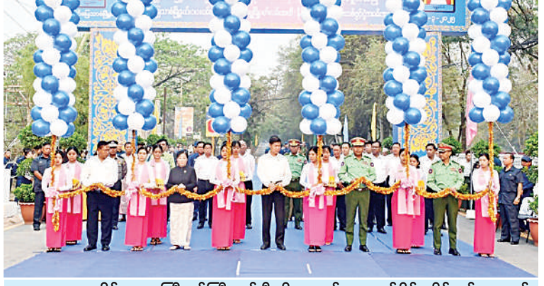
မန္တလေးတိုင်းဒေသကြီးဝန်ကြီးချုပ် ဦးမျိုးအောင်၊ အလယ်ပိုင်းတိုင်းစစ်ဌာနချုပ် တိုင်းမှူး ဗိုလ်မှူးချုပ်ကျော်ကိုထိုက်နှင့် တာဝန်ရှိသူများက နိုင်လွန်ကတ္တရာလမ်းသစ်ကို ဖဲကြိုးဖြတ်ဖွင့်လှစ်ပေးစဉ်။