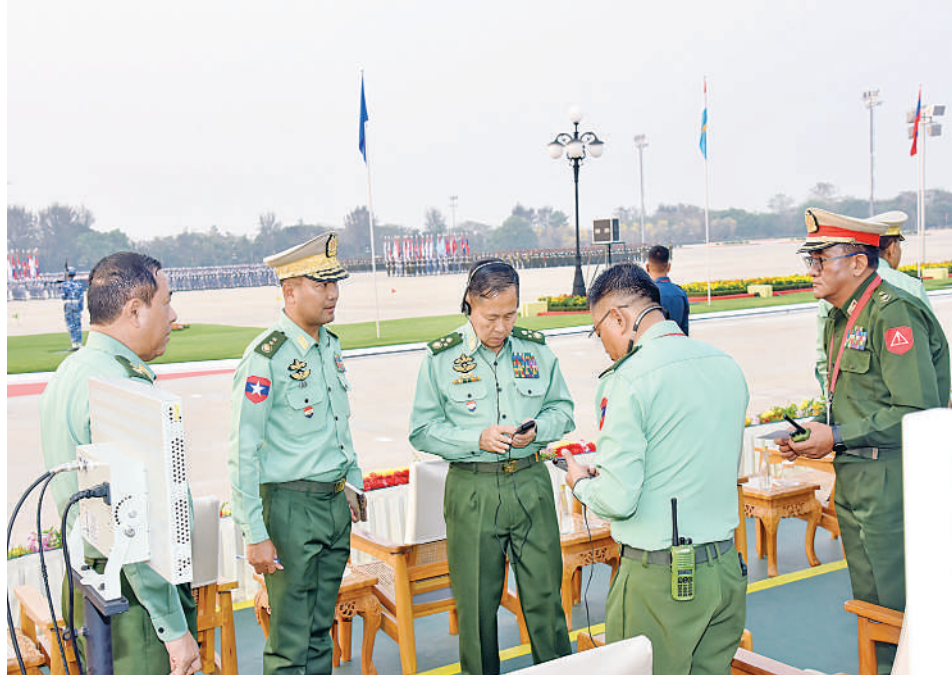
နိုင်ငံတော်စီမံအုပ်ချုပ်ရေးကောင်စီ ဒုတိယဥက္ကဋ္ဌ ဒုတိယတပ်မတော်ကာကွယ်ရေးဦးစီးချုပ် ကာကွယ် ရေးဦးစီးချုပ်(ကြည်း) ဒုတိယဗိုလ်ချုပ်မှူးကြီးစိုးဝင်း နှစ် ၈၀ ပြည့် တပ်မတော်နေ့စစ်ရေးပြအခမ်းအနား၌ ပြည်ပဧည့်သည်တော်ကြီးများအတွက် SIS (Simultaneous Interpretation System) ဘာသာပြန်စက် တပ်ဆင်ထားရှိမှုများကို ကြည့်ရှုစစ်ဆေးစဉ်။

အဆိုပါ စစ်ရေးပြအခမ်းအနားတွင် တပ်မတော်(ကြည်း၊ ရေလေ)နှင့် မြန်မာ နိုင်ငံရဲတပ်ဖွဲ့တို့မှ အရာရှိ၊ စစ်သည်များ၊ အမျိုးသမီးတပ်ဖွဲ့ဝင်များ၊ အမျိုးသမီး အထူးတပ်ဖွဲ့ဝင်များ၊ တပ်မတော်(လေ)မှ လေယာဉ်ရဟတ်ယာဉ်များပါဝင်ကြောင်း သတင်းရရှိသည်။ (၅၀၁)