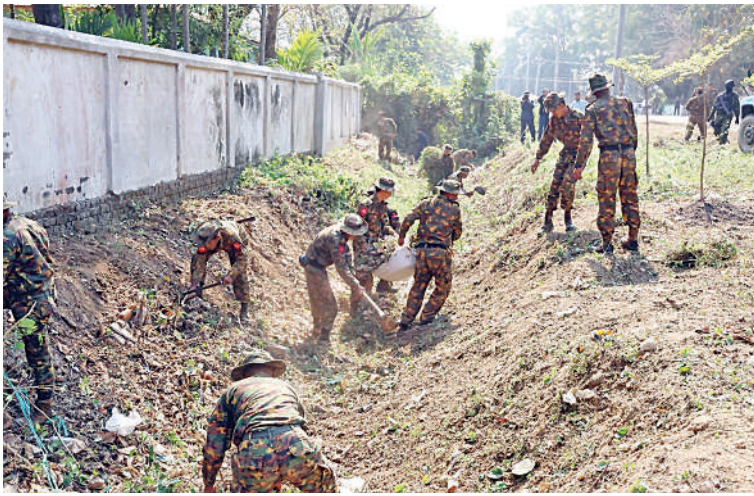
မြစ်ကြီးနားမြို့ အောင်ဇေရန်အောင်ဘုရား၌ နယ်မြေခံတပ်မတော်သားများနှင့် ဌာနဆိုင်ရာဝန်ထမ်းများက စုပေါင်းသန့်ရှင်းရေးဆောင်ရွက်ပေးစဉ်။ (၅၀၁)

နေပြည်တော် မတ် ၂၄ ၂၀၂၅ ခုနှစ် မတ် ၂၇ ရက်တွင် ကျရောက်မည့် နှစ် ၈၀ ပြည့်တပ်မတော်နေ့ကို ကြိုဆိုဂုဏ်ပြုသောအားဖြင့် နယ်မြေခံတပ်မတော်သားများနှင့် ဌာနဆိုင်ရာဝန်ထမ်းများက ယနေ့နံနက်ပိုင်းတွင် ကချင်ပြည်နယ် မြစ်ကြီးနားမြို့ အောင်ဇေရန်အောင်ဘုရား၌ စုပေါင်းသန့်ရှင်းရေးလုပ်ငန်းများ ဆောင်ရွက်ပေးကြသည်။ ထိုသို့ ဆောင်ရွက်ပေးနေမှုများကို ပြည်နယ်ဝန်ကြီးချုပ် ဦးခက်ထိန်နန်၊ မြောက်ပိုင်းတိုင်းစစ်ဌာနချုပ် တိုင်းမှူး ဗိုလ်ချုပ်အောင်ဇော်ထွေးနှင့် တာဝန်ရှိသူများက သွားရောက်ကြည့်ရှုအားပေးပြီး စားသောက်ဖွယ်ရာများ ပေးအပ်ခဲ့ကြောင်း သတင်းရရှိသည်။ (၅၀၁)