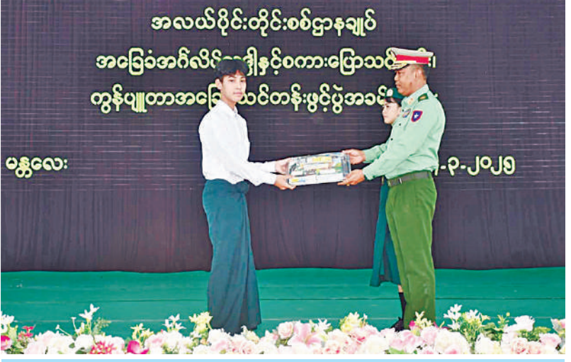
အလယ်ပိုင်းတိုင်းစစ်ဌာနချုပ် တိုင်းမှူး ဗိုလ်မှူးချုပ်ကျော်ကိုထိုက် ကျောင်းသားတစ်ဦး ကို သင်ထောက်ကူပစ္စည်းများနှင့် စာရေးကိရိယာများ ပေးအပ်စဉ်။

ပေါင်းစပ်ညှိနှိုင်းဆောင်ရွက်ပေးသည်။ အလားတူ တိုင်းစစ်ဌာနချုပ်ကွပ်ကဲမှု အောက်တပ်ရင်း၊ တပ်ဖွဲ့များ၌လည်း အဆိုပါနွေရာသီသင်တန်းများကို ဖွင့်လှစ် သင်ကြားပေးလျက်ရှိကြောင်း သတင်း ရရှိသည်။ (၅၀၁)