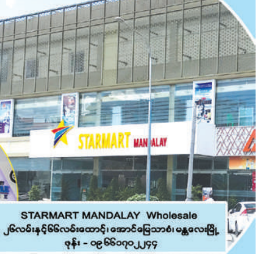
STARMART MANDALAY Wholesale ၂၆လမ်းနှင့်၆၆လမ်းထောင့်၊ အောင်မြေသာစံ၊ မန္တလေးမြို့၊ ဖုန်း - ၀၉ ၆၆၀၇၀၂၂၄၄

အရည်အသွေးဖြင့် စားသောက်ကုန်များ အပါအဝင် ထုတ်ကုန်ပစ္စည်းအမျိုးမျိုးကို ပိတ်ဂတ်ပရိ လက်လီလက်ကား ဝယ်ယူရရှိနိုင်ပါသည်။