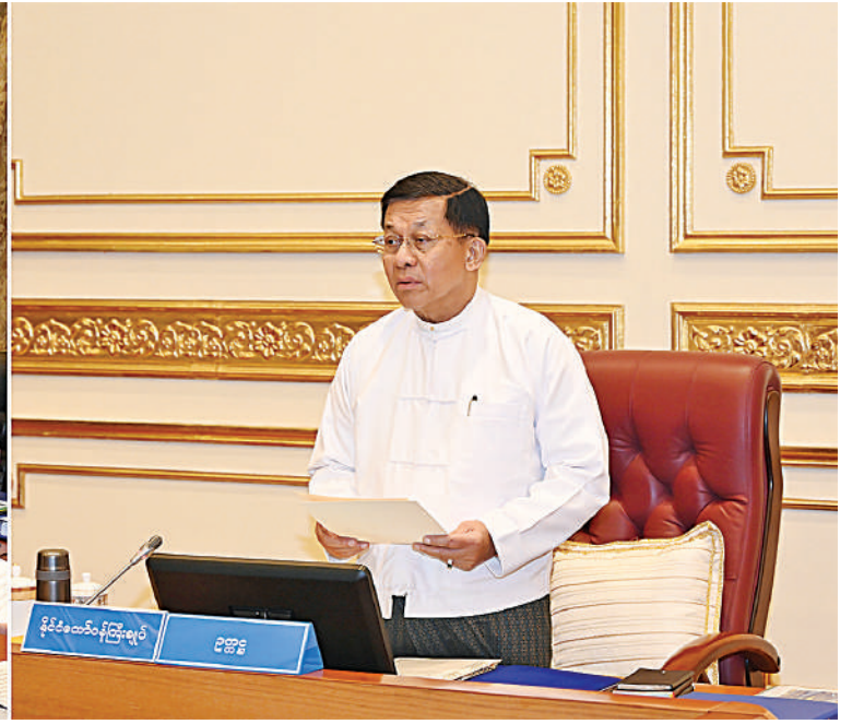
ဘဏ္ဍာရေးဆိုင်ရာကော်မရှင်ဥက္ကဋ္ဌ နိုင်ငံတော်စီမံအုပ်ချုပ်ရေးကောင်စီဥက္ကဋ္ဌ နိုင်ငံတော်ဝန်ကြီးချုပ် ဗိုလ်ချုပ်မှူးကြီးမင်းအောင်လှိုင် ဘဏ္ဍာရေးဆိုင်ရာကော်မရှင်အစည်းအဝေးတွင် အမှာစကားပြောကြားစဉ်။