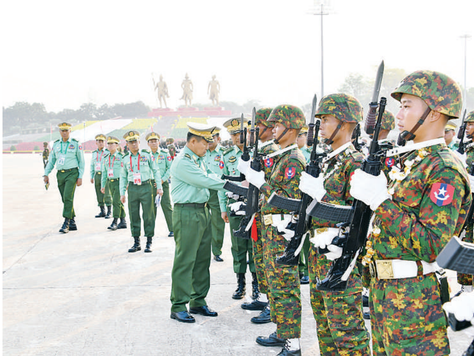
နိုင်ငံတော်စီမံအုပ်ချုပ်ရေးကောင်စီ ဒုတိယဥက္ကဋ္ဌ ဒုတိယတပ်မတော်ကာကွယ်ရေးဦးစီးချုပ် ကာကွယ် ရေးဦးစီးချုပ်(ကြည်း) ဒုတိယဗိုလ်ချုပ်မှူးကြီးစိုးဝင်း နှစ် ၈၀ ပြည့် တပ်မတော်နေ့စစ်ရေးပြအခမ်းအနား၌ ပါဝင်စစ်ရေးပြကြမည့် စစ်ကြောင်းတပ်ခွဲများ၏ ဝတ်စားဆင်ယင်မှုဆိုင်ရာများကို ကြည့်ရှုစစ်ဆေးစဉ်။

ဗိုလ်ချုပ်ကြီးမောင်မောင်အေးပြည်ထဲရေး ဝန်ကြီးဌာန ပြည်ထောင်စုဝန်ကြီး ဒုတိယ ဗိုလ်ချုပ်ကြီးထွန်းထွန်းနောင်၊ ညိုနှိုင်းကွပ် ကဲရေးမှူး(ကြည်း၊ ရေလေ) ဗိုလ်ချုပ်ကြီး