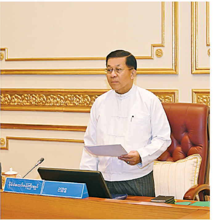
အမျိုးသားစီမံကိန်းကော်မရှင်ဥက္ကဋ္ဌ နိုင်ငံတော်စီမံအုပ်ချုပ်ရေးကောင်စီဥက္ကဋ္ဌ နိုင်ငံတော်ဝန်ကြီးချုပ် ဗိုလ်ချုပ်မှူးကြီးမင်းအောင်လှိုင် အမျိုးသားစီမံကိန်းကော်မရှင်အစည်းအဝေးတွင် အမှာစကားပြောကြားစဉ်။