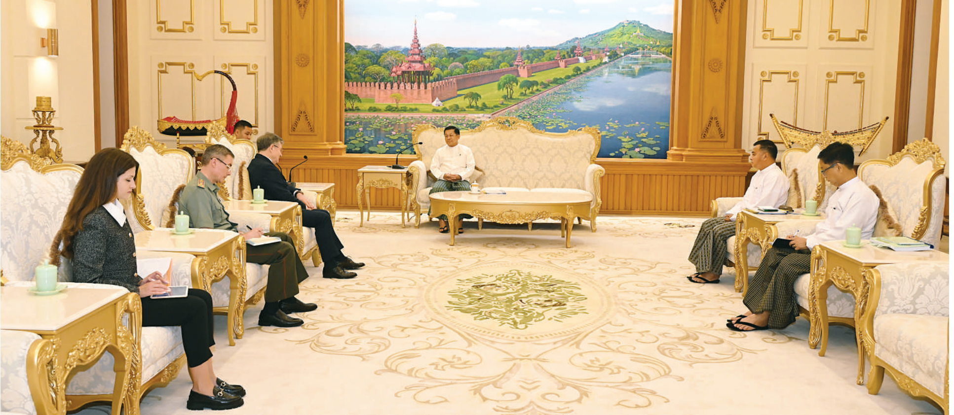
နိုင်ငံတော်စီမံအုပ်ချုပ်ရေးကောင်စီဥက္ကဋ္ဌ နိုင်ငံတော်ဝန်ကြီးချုပ် ဗိုလ်ချုပ်မှူးကြီးမင်းအောင်လှိုင်ထံ မြန်မာနိုင်ငံဆိုင်ရာ ရုရှားဖက်ဒရေးရှင်းနိုင်ငံ သံအမတ်ကြီး H.E. Mr. Iskander Azizov က လာရောက်ဂါရဝပြုတွေ့ဆုံစဉ်။

နေပြည်တော် မတ် ၂၀ နိုင်ငံဆိုင်ရာ ရုရှားဖက်ဒရေးရှင်းနိုင်ငံ ရုံး ဧည့်ခန်းမ၌ လာရောက်ဂါရဝပြု ဝန်ကြီးချုပ်နှင့်အတူ ကောင်စီတွဲဖက် မြန်မာနိုင်ငံဆိုင်ရာ ရုရှားဖက်ဒရေးရှင်း နိုင်ငံတော်စီမံအုပ်ချုပ်ရေးကောင်စီ သံအမတ်ကြီး H.E. Mr. Iskander Azizov တွေ့ဆုံသည်။ အတွင်းရေးမှူး ဗိုလ်ချုပ်ကြီးရဲဝင်းဦး၊ နိုင်ငံ သံအမတ်ကြီးနှင့်အတူ မြန်မာနိုင်ငံ ဥက္ကဋ္ဌ နိုင်ငံတော်ဝန်ကြီးချုပ် က ယနေ့နံနက်ပိုင်းတွင် နေပြည်တော်ရှိ အဆိုပါတွေ့ဆုံပွဲသို့ နိုင်ငံတော်စီမံ နိုင်ငံခြားရေးဝန်ကြီးဌာန ဒုတိယဝန်ကြီး ဆိုင်ရာ ရုရှားစစ်သံမှူးနှင့် ဗိုလ်ချုပ်မှူးကြီးမင်းအောင်လှိုင်ထံ မြန်မာ နိုင်ငံတော်စီမံအုပ်ချုပ်ရေးကောင်စီဥက္ကဋ္ဌ အုပ်ချုပ်ရေးကောင်စီဥက္ကဋ္ဌ နိုင်ငံတော် ဦးလွင်ဦးတို့ တက်ရောက်ကြပြီး စာမျက်နှာ ၁၈ ကော်လံ ၁ ပု