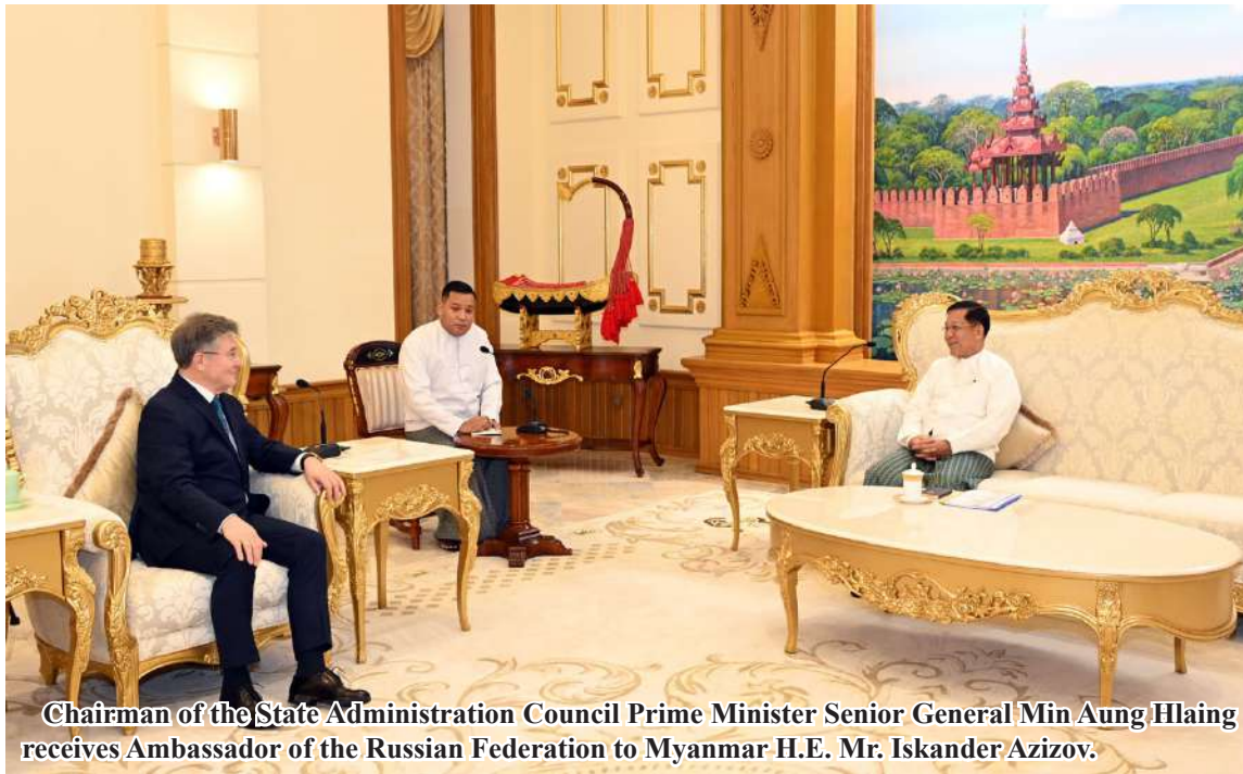
Chairman of the State Administration Council Prime Minister Senior General Min Aung Hlaing receives Ambassador of the Russian Federation to Myanmar H.E. Mr. Iskander Azizov.

Nay Pyi Taw March 20 Visit to the Russian Federation, during which, friendship and co-operation between the two countries could be further cemented, progress in implementing the agreements reached during the goodwill visit and materialization of the remaining parts through discussions, further promotion of cooperation between the parliaments of Myanmar and Russia, sending of delegations to study the parliaments of Russia, further cementing of cooperation in defence, humanitarian activities and other multiple sectors, and exchange of goodwill visits between the two countries were cordially exchanged. Ambassador of the Russian Federation to Myanmar H.E. Mr. Iskander Azizov paid a courtesy call on Chairman of the State Administration Council Prime Minister Senior General Min Aung Hlaing at the parlour of State Administration Council Chairman's Office here this morning. Also present at the call together with the Senior General were Joint SAC Secretary General Ye Win Oo and Deputy Minister for Foreign Affairs U Lwin Oo. The Russian ambassador was accompanied by the Russian military attaché to Myanmar and officials. During the talks, views on the Senior General's successful State