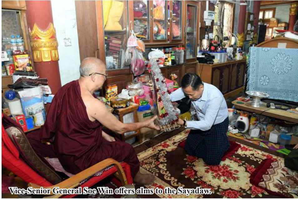
Vice-Senior General Soe Win offers alms to the Sayadaw.