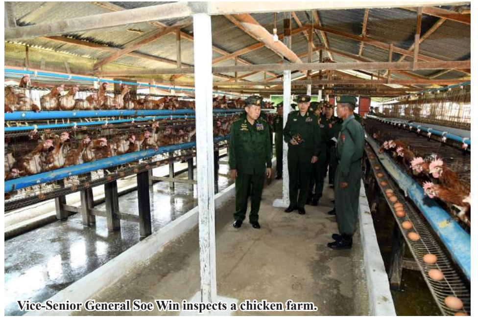
Vice-Senior General Soe Win inspects a chicken farm.

Additionally, the Vice-Senior General and wife and party visited the Hsutaung-pyae Bamboo Pagoda in Kalaw this morning, offering flowers, water, oil lamps and gold foils. They also paid homage and donated alms to the presiding Sayadaw. 100