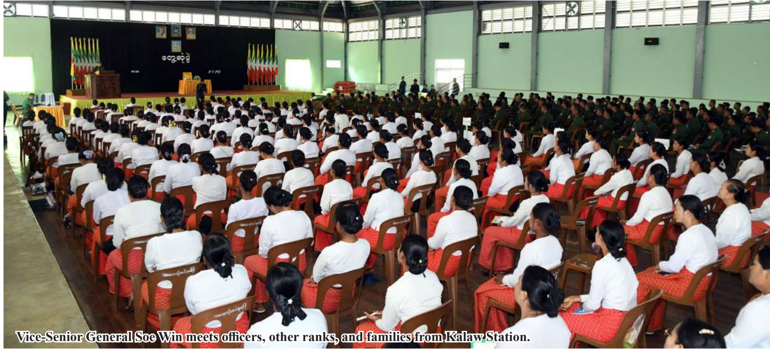
Vice-Senior General Soe Win meets officers, other ranks, and families from Kalaw Station.