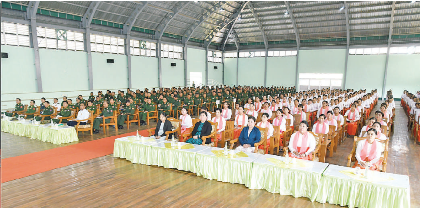
နိုင်ငံတော်စီမံအုပ်ချုပ်ရေးကောင်စီ ဒုတိယဥက္ကဋ္ဌ ဒုတိယတပ်မတော်ကာကွယ်ရေးဦးစီးချုပ် ကာကွယ်ရေးဦးစီးချုပ်(ကြည်း) ဒုတိယဗိုလ်ချုပ်မှူးကြီးစိုးဝင်း ကလောတပ်နယ်မှ အရာရှိ၊ စစ်သည်၊ မိသားစုများကို တွေ့ဆုံအမှာစကားပြောကြားစဉ်။