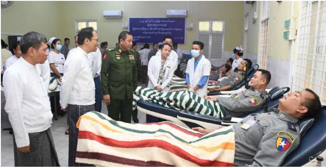
ပြည်ထဲရေးဝန်ကြီးဌာန ပြည်ထောင်စုဝန်ကြီး ဒုတိယဗိုလ်ချုပ်ကြီးထွန်းထွန်းနောင် မြန်မာနိုင်ငံရဲတပ်ဖွဲ့ဝင်များနှင့် စာရေးဝန်ထမ်းများစုပေါင်းသွေးလှူဒါန်းနေမှုကို ကြည့်ရှုအားပေးစဉ်။

နေပြည်တော် မတ် ၂၀ ၂၀၂၅ ခုနှစ် မတ် ၂၇ ရက်တွင် ကျရောက်မည့် နှစ် ၈၀ ပြည့် တပ်မတော်နေ့ကို ကြိုဆိုဂုဏ်ပြုသောအားဖြင့် ပြည်ထဲရေးဝန်ကြီးဌာန မြန်မာနိုင်ငံရဲတပ်ဖွဲ့ဝင်များနှင့် စာရေးဝန်ထမ်းများက နေပြည်တော် ဧည့်သည်တော်များနှင့် နေပြည်တော်ပြည်သူ့ဆေးရုံကြီး (ခုတင်-၁၀၀၀)နှင့် ဧည့်သည်တော်များနှင့် တပ်မတော်ဆေးရုံကြီး (ခုတင်-၁၀၀၀) တို့၌ စုပေါင်းသွေးလှူဒါန်းခဲ့ကြသည်။ ဂုဏ်ပြု သွေးလှူဒါန်းခြင်းများကို ယနေ့နံနက်ပိုင်းတွင် အဆိုပါဆေးရုံကြီးများ၌ မြန်မာနိုင်ငံရဲတပ်ဖွဲ့ဌာနချုပ်ရှိ ဌာနကြီးများနှင့် တပ်ဖွဲ့အသီးသီးမှ တပ်ဖွဲ့ဝင်နှင့် စာရေးဝန်ထမ်း စုစုပေါင်း ၁၅၂ ဦးတို့က တစ်ချိန်တည်း ဂုဏ်ပြု သွေးလှူဒါန်းခဲ့ကြသည်။ အဆိုပါဆေးရုံကြီးများ၌ ဂုဏ်ပြုသွေးလှူဒါန်းခဲ့ကြသည့် သွေးလှူရှင်တပ်ဖွဲ့ဝင်နှင့် စာရေးဝန်ထမ်းများကို ပြည်ထဲရေးဝန်ကြီးဌာန ပြည်ထောင်စုဝန်ကြီး ဒုတိယဗိုလ်ချုပ်ကြီး ထွန်းထွန်းနောင်၊