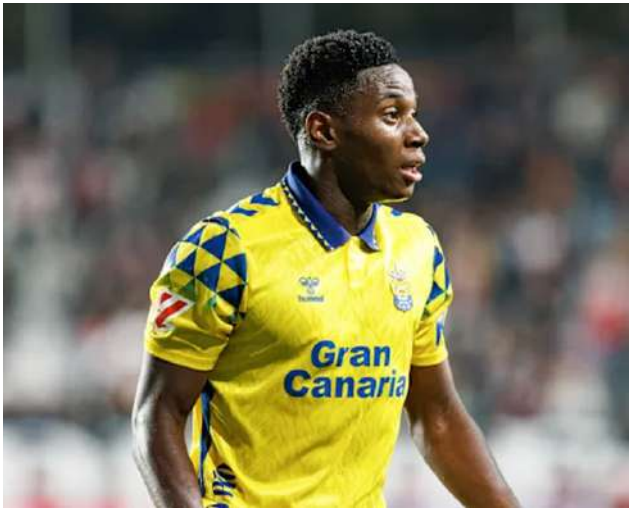
၄၁ ဒသမ ၉ သန်းဖြင့် ခေါ်ယူခဲ့ပြီး ရက်ပိုင်းအကြာတွင် လူငယ်ခံစစ် ကစားသမား အက်ဆူဂိုကို စတာ လင်ပေါင် ၁၈ ဒသမ ၅ သန်းဖြင့် ထပ်မံ ခေါ်ယူနိုင်ခဲ့သောကြောင့် ကစားသမားနှစ်ဦးအတွက် စတာ လင်ပေါင် သန်း ၆၀ နီးပါး အသုံး ပြုခဲ့ရကြောင်း သိရသည်။ Ref : Sky sports Trs : ML

လစွာတွန်း မတ် ၂၀ ချယ်ဆီးအသင်းသည် စပို့တင်း လစွာတွန်းအသင်းမှ တောင်ပံ ကစားသမား ကွမ်ဒါကို ခေါ်ယူ ခဲ့ပြီးနောက် ခံစစ်ကစားသမား အက်ဆူဂိုကို ထပ်မံခေါ်ယူရန် ဆွေးနွေးခဲ့ရာ သဘောတူညီမှုရရှိခဲ့ သဖြင့် ကစားသမားနှစ်ဦးစလုံးကို ခေါ်ယူနိုင်ခဲ့ကြောင်း စပို့တင်း လစွာတွန်းအသင်းက ထုတ်ပြန် ကြေညာခဲ့သည်။ ချယ်ဆီးအသင်းသည် အသက် ၂၀ ရှိ ခံစစ်ကစားသမား အက်ဆူဂို အတွက် ပြောင်းရွှေ့ကြေး စတာ လင်ပေါင် ၁၈ ဒသမ ၅ သန်း အသုံးပြုခဲ့ရပြီး လက်ရှိတွင် လူငယ်ကစားသမား အနေဖြင့် ချယ်ဆီးအသင်းနှင့် ဆေးစစ်မှု အောင်မြင်ခဲ့သဖြင့် လာမည့် နွေရာသီတွင် အသင်းနှင့်ပူးပေါင်း သွားမည်ဖြစ်ကြောင်း သိရသည်။ အက်ဆူဂိုသည် စပို့တင်း လစွာတွန်းအသင်းတွင် အသက် ၁၆ နှစ်အရွယ်ကတည်းက အသင်းကြီး နှင့် ပါဝင်ခွင့်ရခဲ့သဖြင့် အသက် အငယ်ဆုံး ပွဲထွက်ကစားသမား အဖြစ် ရပ်တည်နိုင်ခဲ့ပြီး ပြီးခဲ့သည့် နွေရာသီ အပြောင်းအရွှေ့ကာလ က လာလီဂါကလပ် လက်ပါးမက် အသင်းသို့ တစ်ရာသီအငှား စာချုပ်ဖြင့် ပြောင်းရွှေ့ကစားခဲ့ရာ အသင်းတွင် ပုံစံကောင်းပြသနိုင်ခဲ့ သောကြောင့် ချယ်ဆီးအသင်းက ခေါ်ယူရန်ဆုံးဖြတ်ခဲ့ခြင်းဖြစ်သည်။ ချယ်ဆီးအသင်း အနေဖြင့် ကွမ်ဒါကို စာချုပ်သက်တမ်း ခုနစ် နှစ်ကျန်ရှိနေသော်လည်း စာချုပ် ဖျက်သိမ်းကြေး စတာလင်ပေါင်