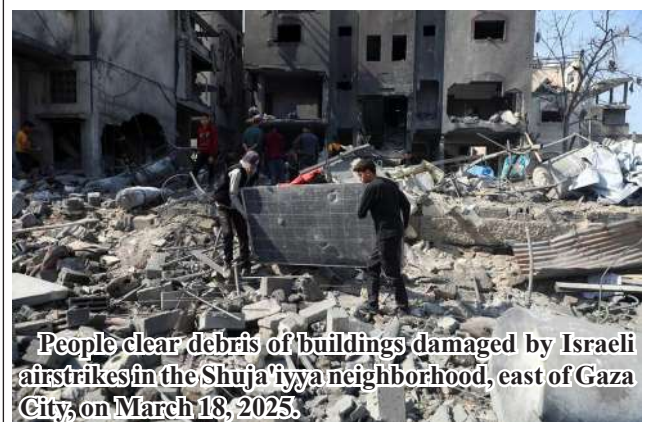
People clear debris of buildings damaged by Israeli airstrikes in the Shuja'iyya neighborhood, east of Gaza City, on March 18, 2025.