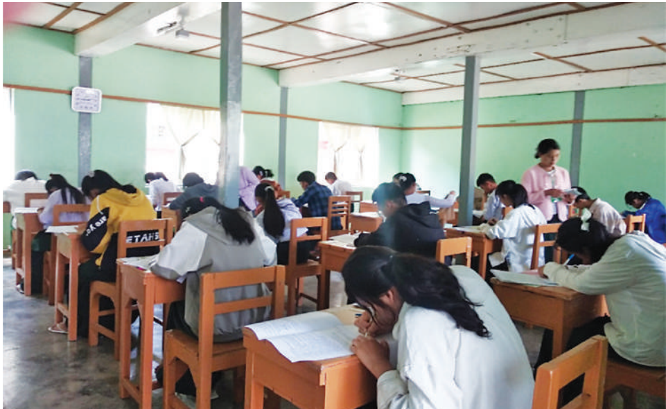
၂၀၂၄-၂၀၂၅ ပညာသင်နှစ် တက္ကသိုလ်ဝင်စာမေးပွဲ စတုတ္ထနေ့အဖြစ် ဓာတုဗေဒဘာသာရပ်နှင့် ပထဝီဝင်ဘာသာရပ်တို့အား ကျောင်းသား၊ ကျောင်းသူများ ဖြေဆိုနေမှုကို တွေ့ရစဉ်။

နေပြည်တော် မတ် ၂၀ ၂၀၂၄-၂၀၂၅ ပညာသင်နှစ် တက္ကသိုလ်ဝင် စာမေးပွဲကို မတ် ၁၇ ရက်တွင် စတင်ကျင်းပ လျက်ရှိရာ ယနေ့တွင် စတုတ္ထနေ့အဖြစ် ဓာတုဗေဒဘာသာရပ်နှင့် ပထဝီဝင်ဘာသာရပ်တို့ကို တိုင်းဒေသကြီးနှင့် ပြည်နယ် အသီးသီးရှိ အခြေခံပညာအထက်တန်း ကျောင်းများ၌ ကျောင်းသား၊ ကျောင်းသူ များ ဝင်ရောက်ဖြေဆိုလျက်ရှိသည်။ ဦးစွာ စာမေးပွဲဖြေဆိုခြင်းမပြုမီ ဆရာ၊ ဆရာမများက ကျောင်းသား၊ ကျောင်းသူ များကို စာမေးပွဲဖြေဆိုခွင့်ကတ်များ မှန်၊ မမှန် စစ်ဆေးခြင်းများနှင့် လိုအပ်သည့် စစ်ဆေးမှုများကို စာမေးပွဲစည်းမျဉ်း စည်းကမ်းများနှင့်အညီ စနစ်တကျ ဆောင်ရွက်ကြသည်။ ယင်းသို့ ကျောင်းသား၊ ကျောင်းသူများ စိတ်အေးချမ်းသာစွာ ဖြေဆိုနိုင်ရေးအတွက် ကျောင်းဝင်းအတွင်းနှင့် အပြင်များ၌ သက်ဆိုင်ရာ လုံခြုံရေးအဖွဲ့ဝင်များ၊ ကျန်းမာရေးဝန်ထမ်းများ၊ မီးသတ်တပ်ဖွဲ့ဝင်