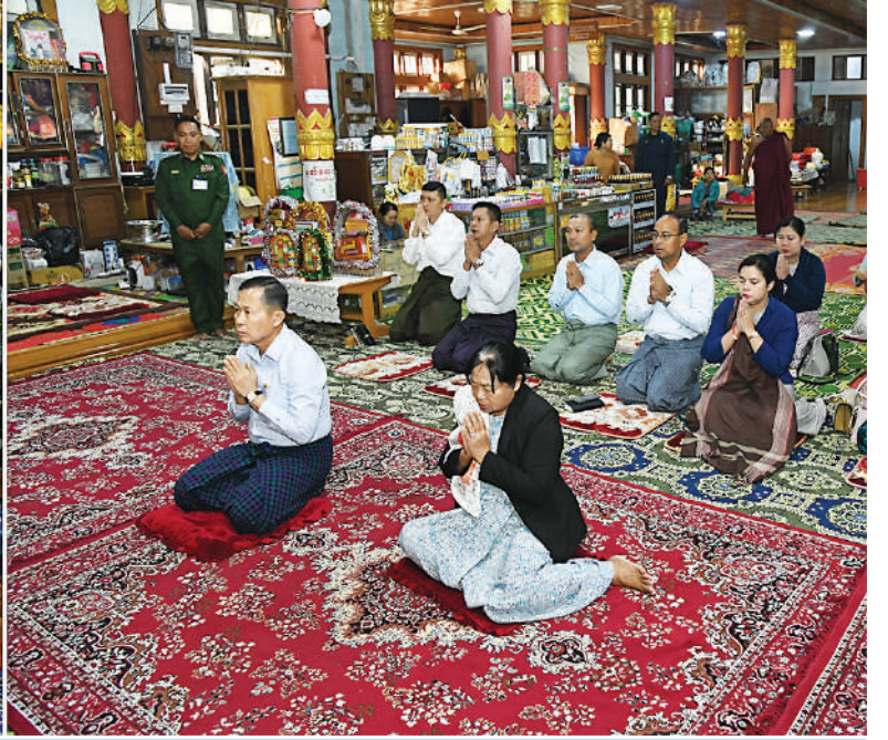
နိုင်ငံတော်စီမံအုပ်ချုပ်ရေးကောင်စီဒုတိယဥက္ကဋ္ဌ ဒုတိယတပ်မတော်ကာကွယ်ရေးဦးစီးချုပ် ကာကွယ်ရေးဦးစီးချုပ်(ကြည်း) ဒုတိယဗိုလ်ချုပ်မှူးကြီးစိုးဝင်းနှင့် ဇနီး ဒေါ်သန်းသန်းနွယ် ကလောမြို့ရှိ ဆုတောင်းပြည့်နီးဘုရားအား ပန်း၊ ရေချမ်း၊ ဆီမီးများ ထွန်းညှိပူဇော်ဖူးမြော်ကြည့်ပါစဉ်။