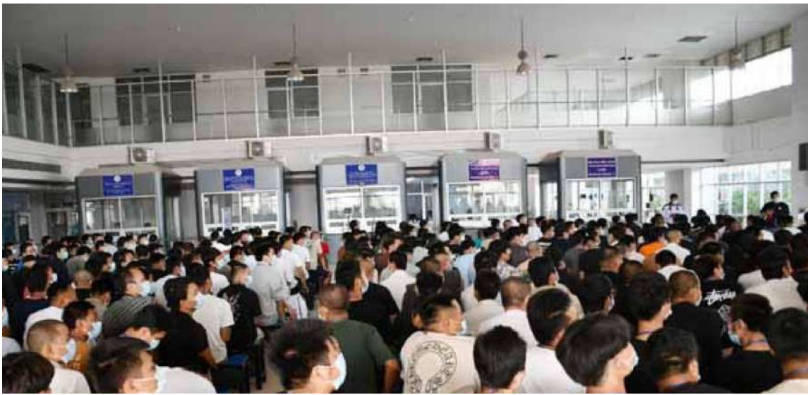
နယ်စပ်ဒေသများတွင် ဖြစ်ပေါ်လျက်ရှိသည့် အွန်လိုင်းလိမ်လည်မှု (Telecom Fraud) နှင့် ဒုစရိုက်မှုလုပ်ငန်းများတွင် ဆက်စပ်ပါဝင်ခဲ့ကြသည့် တရုတ်နိုင်ငံသား ၃၇၉ ဦး လွှဲပြောင်းပေးအပ်ခဲ့ပြီး ပြည်ပနိုင်ငံသား ၂၅၃ ဦး ထပ်မံ စစ်ဆေးဖော်ထုတ် ထိန်းသိမ်းနိုင်ခဲ့မှု မှတ်တမ်းဓာတ်ပုံ။