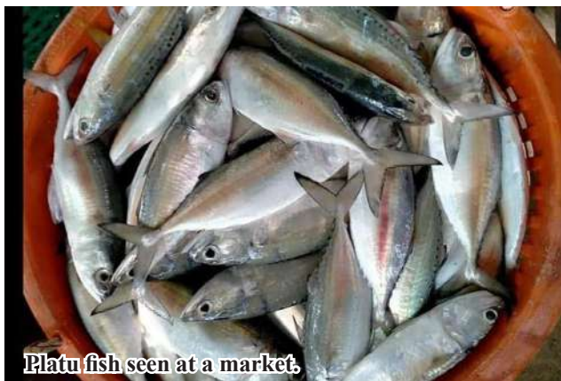
Platu fish seen at a market.