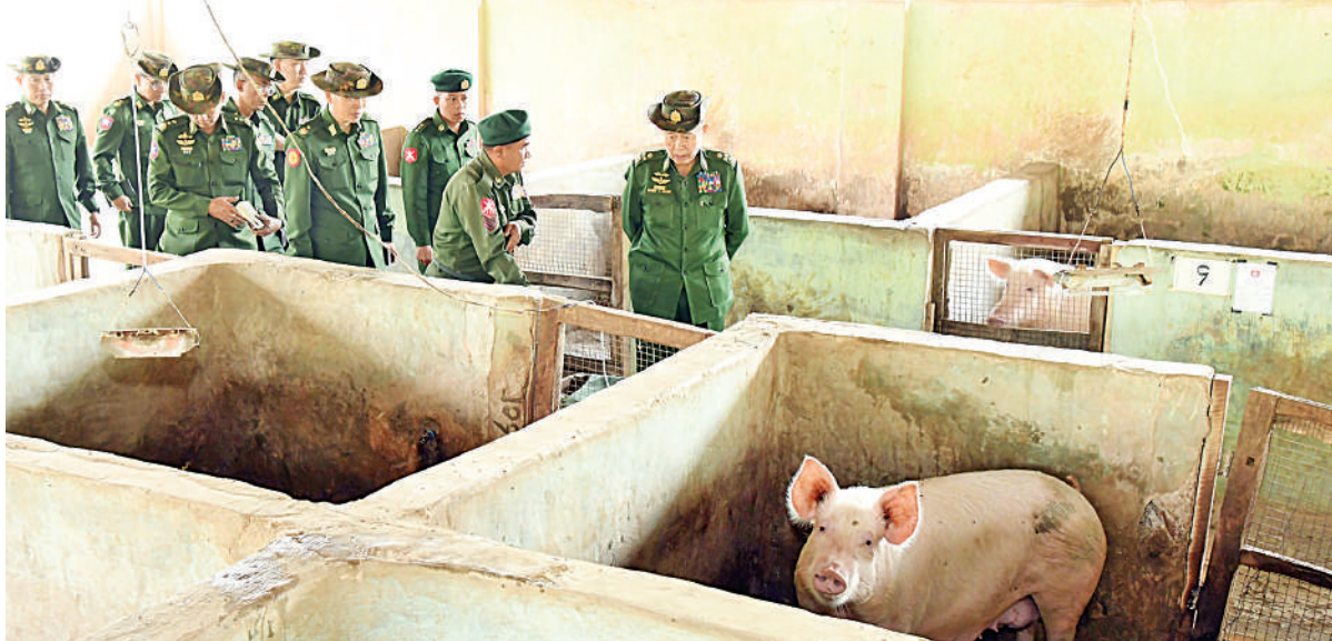
နိုင်ငံတော်စီမံအုပ်ချုပ်ရေးကောင်စီဒုတိယဥက္ကဋ္ဌ ဒုတိယတပ်မတော်ကာကွယ်ရေးဦးစီးချုပ် ကာကွယ်ရေးဦးစီးချုပ်(ကြည်း) ဒုတိယ ဗိုလ်ချုပ်မှူးကြီးစိုးဝင်း နယ်မြေခံတပ်ရင်း၊တပ်ဖွဲ့များအတွင်း DYL ဝက် မွေးမြူထားရှိမှုကို ကြည့်ရှုစစ်ဆေးစဉ်။

နှင့် စစ်သည်တော်ကျင့်ဝတ်အပါး ၆၀ ကို ခါးဝတ်ပုဆိုးကဲ့သို့ မြဲမြံစွာကျင့်ကြံနေထိုင် သွားရန်လိုကြောင်း။ တပ်မတော်သားများ၏လုပ်ငန်းသဘော သဘာဝအရ ခက်ခဲကြမ်းတမ်း၍ ပင်ပန်း ဆင်းရဲသော ရည်မှန်းချက်တာဝန်များ ထမ်းဆောင်နေရသူများဖြစ်၍ အမြဲကိုယ်ခန္ဓာ ကျန်းမာသန်စွမ်း၍ လိုအပ်သလို စိတ်ဓာတ် ကလည်း ကြံ့ခိုင်နေရမည်ဖြစ်ကြောင်း၊ မိမိတို့ တပ်မတော်သားတစ်ဦးချင်းသည် မည်မျှပင် နိုင်ငံတော်တာဝန်ကို ကျေပွန်စွာထမ်းဆောင် ချင်သည်ဖြစ်စေ ကိုယ်ခန္ဓာကျန်းမာရေးနှင့် စိတ်ဓာတ်ကြံ့ခိုင်မှုချို့ယွင်းချက်ရှိမည်ဆိုပါ က မည်သို့မျှပေးအပ်လာသည့်တာဝန်ဝတ္တရား များမှန်သမျှကို အောင်မြင်စွာလုပ်ကိုင် ဆောင်ရွက်နိုင်မည် မဟုတ်သည့်အတွက် ကိုယ်စိတ်နှစ်ပါးကျန်းမာကြံ့ခိုင်မှုကောင်းမွန်