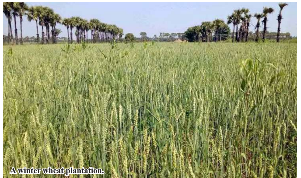
A winter wheat plantation.