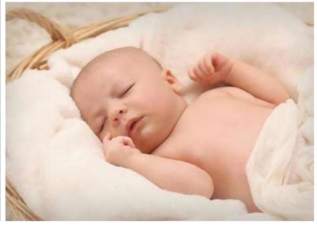
Ref : Sputnik News Trs : KKO

ဆိုဒ်လ် မတ် ၂၀ မိခင်ထံမှရရှိသော မျိုးဗီဇများ သည် မွေးရာပါနှလုံးချို့ယွင်းမှုရှိ သူ ကလေးများ၌ ကင်ဆာရောဂါ ဖြစ်ပွားရေးအတွက် နောက်ခံ အခြေအနေများ ဖန်တီးပေးနိုင် ဖွယ်ရှိကြောင်း သိရသည်။ တောင်ကိုရီးယား သုတေသန ပညာရှင်များသည် ၂၀၀၅ ခုနှစ်နှင့် ၂၀၁၉ ခုနှစ်ကြား မွေးဖွားခဲ့သည့် ကလေး ၃ ဒသမ ၅ သန်းကို ၁၀ နှစ်ကြာ စောင့်ကြည့်လေ့လာခဲ့ ပြီးနောက် ၎င်းတို့၏တွေ့ရှိချက် ကို တင်ပြခဲ့ခြင်းဖြစ်သည်။ တောင်ကိုရီးယား သုတေသန ပညာရှင်များ၏အဆိုအရ မွေးရာပါ နှလုံးချို့ယွင်းချက်ပါသူ ကလေး များ မွေးဖွားခဲ့ကြသော မိခင်များ တွင်လည်း ကင်ဆာရောဂါများဖြစ် နိုင်ခြေ ပုံမှန်ထက် ၁၇ ရာခိုင် နှုန်း မြင့်တက်လာနိုင်ကြောင်း သိရသည်။