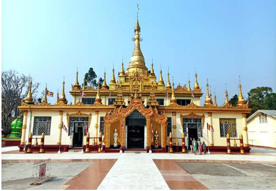
ပြင်ဦးလွင်မြို့ရှိ မဟာရွှေမြင်တင်စေတီတော်ကြီးကို ဖူးတွေ့ရစဉ်။

ဦးခန္တီဘုရားဖူးပြီးသွားတာနဲ့ စာပေမိတ်ဆွေက လက်ဖက်ရည်တစ်ခွက်လောက် သွားသောက်ကြရ အောင်ဆိုပြီး စကားကမ်းလှမ်းလာတယ်။ ဒါကြောင့် စာရေးသူက နောက်ထပ်သွားရောက်ကြမဲ့နေရာက သူရမချစ်ပိုအုတ်ဂူဖြစ်ကြောင်းနဲ့ စာရေးသူရဲ့ နေအိမ်နဲ့ သူရမချစ်ပိုအုတ်ဂူနေရာနဲ့က တစ်လမ်း တည်း ဟိုဘက်ထိပ်ဒီဘက်ထိပ်ဖြစ်ကြောင်း ပြောပြ လိုက်ပြီး လက်ဖက်ရည်ဆိုင်ကိုမသွားတော့ဘဲ စာရေးသူရဲ့နေအိမ်ရှိရာကို ဦးတည်ခေါ်ဆောင်လာခဲ့ လိုက်တယ်။ အိမ်ကိုရောက်တော့မှ လက်ဖက်ရည် သောက် စကားပြောကြရင်း သူရမချစ်ပိုနဲ့ပတ်သက် ပြီး ရေးသားထုတ်ဝေထားတဲ့ စာအုပ်တစ်အုပ်ကိုလဲ လက်ဆောင်အဖြစ် ပေးလိုက်တယ်။ စကားပြော၊ လက်ဖက်ရည်သောက် တစ်ခဏလောက်နားပြီးရင် သူရမချစ်ပို အုတ်ဂူရှိရာကို ဆက်လက်သွားရောက် လေ့လာမှာပါ။ စာပေမိတ်ဆွေကတော့ ဦးခန္တီဘုရား၊ ရှေးဟောင်းသမိုင်းဝင် မဟာရွှေမြင်တင်၊ ရန်အောင် မြင်မင်္ဂလာကန်တော်တွေကိုရောက်ရှိခဲ့လို့ စာရေး သူကိုကျေးဇူးတင်ကြောင်းတွေ ပြောဆိုနေပါတယ်။