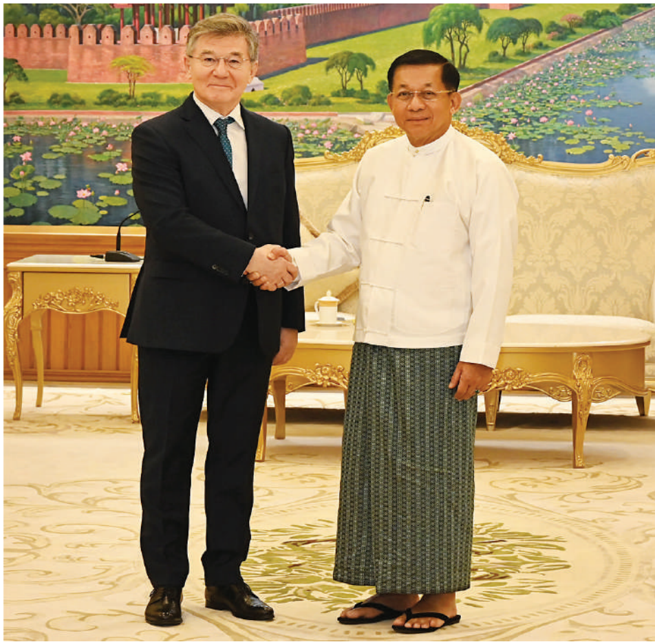
နိုင်ငံတော်စီမံအုပ်ချုပ်ရေးကောင်စီဥက္ကဋ္ဌ နိုင်ငံတော်ဝန်ကြီးချုပ် ဗိုလ်ချုပ်မှူးကြီးမင်းအောင်လှိုင် မြန်မာနိုင်ငံဆိုင်ရာ ရုရှားဖက်ဒရေးရှင်းနိုင်ငံသံအမတ်ကြီး H. E. Mr. IskanderAzizov ကို ရင်းရင်းနှီးနှီးနှုတ်ဆက်စဉ်။

ရေဖုံးမှအဆက် တာဝန်ရှိသူတို့ တက်ရောက်ကြသည်။ ထိုသို့တွေ့ဆုံရာတွင် နိုင်ငံတော်စီမံအုပ်ချုပ်ရေးကောင်စီဥက္ကဋ္ဌ နိုင်ငံတော်ဝန်ကြီးချုပ်၏ ရုရှားဖက်ဒရေးရှင်းနိုင်ငံသို့ သွားရောက်ခဲ့သည့် နိုင်ငံတော်အဆင့် ချစ်ကြည်ရေးခရီးစဉ်အတွင်း နှစ်နိုင်ငံအကြား ချစ်ကြည်ရင်းနှီးမှုနှင့် ပူးပေါင်းဆောင်ရွက်မှုများ ပိုမိုတိုးတက်အောင်ဆောင်ရွက်နိုင်ခဲ့ကြောင်း အောင်မြင်သည့်ခရီးစဉ်ဖြစ်ခဲ့မှုအခြေအနေများ၊ ချစ်ကြည်ရေးခရီးစဉ်အတွင်းရရှိခဲ့သည့် သဘောတူညီချက်များကို ဆက်လက်အကောင်အထည်ဖော် ဆောင်ရွက်လျက်ရှိမှုအခြေအနေများနှင့် ဆွေးနွေးရန်ကျန်ရှိသည့် အချက်များကို ဆက်လက်ဆွေးနွေး အကောင်အထည်ဖော်