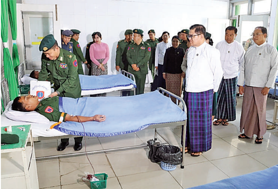
ကျင်ပြည်နယ်ဝန်ကြီးချုပ် ဦးခက်ထိန်နန်နှင့် မြောက်ပိုင်းတိုင်းစစ်ဌာနချုပ် တိုင်းမှူး ဗိုလ်ချုပ်အောင်စော်ထွေး သွေးအလှူရှင်များ စုပေါင်းသွေးလှူဒါန်းနေမှုကို ကြည့်ရှုအားပေးပြီး အာဟာရဖြည့်စားသောက်ဖွယ်ရာများ ပေးအပ်ချီးမြှင့်စဉ်။

နေပြည်တော် မတ် ၂၀ ဦးစွာ အရာရှိ စစ်သည်၊ မိသားစုဝင်များ၊ မြန်မာနိုင်ငံရဲတပ်ဖွဲ့ဝင်များ၊ မြန်မာနိုင်ငံမီးသတ်တပ်ဖွဲ့ဝင်များ၊ ဌာနဆိုင်ရာဝန်ထမ်းများ၊ စေတနာရှင်သွေးအလှူရှင် ပြည်သူများ၊ သွေးအလှူရှင်စုစုပေါင်း ၁၈၅ ဦးတို့ကို လိုအပ်သည့် ကျန်းမာရေးစစ်ဆေးပေးခြင်း၊ သွေးပေါင်ချိန်ခြင်းနှင့် သွေးအုပ်စုခွဲခြားခြင်းများ ဆောင်ရွက်ပေးပြီး သတ်မှတ်နေရာအသီးသီး၌ စုပေါင်းသွေးလှူဒါန်းကြသည်။ ထိုသို့သွေးလှူဒါန်းနေမှုများကို ကျင်ပြည်နယ်ဝန်ကြီးချုပ်၊ တိုင်းမှူးနှင့် တာဝန်ရှိသူများက လိုက်လံကြည့်ရှုအားပေးကာ သွေးအလှူရှင်များအတွက် အာဟာရဖြည့်စားသောက်ဖွယ်ရာများ ပေးအပ်ချီးမြှင့်ခဲ့ကြောင်း သတင်းရရှိသည်။ (၅၀၁)