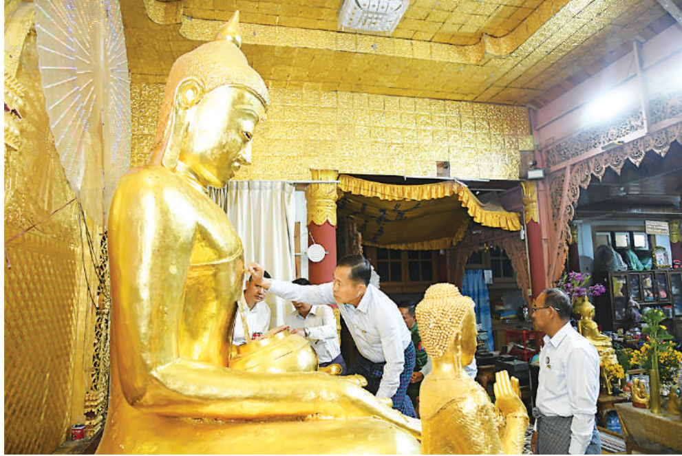
နိုင်ငံတော် စီမံအုပ်ချုပ်ရေး ကောင်စီ ဒုတိယဥက္ကဋ္ဌ ဒုတိယတပ်မတော် ကာကွယ်ရေး ဦးစီးချုပ် ကာကွယ်ရေး ဦးစီးချုပ်(ကြည်း) ဒုတိယဗိုလ်ချုပ်မှူးကြီး စိုးဝင်း ဆုတောင်းပြည့် နီးဘုရားအား ရွှေသင်္ကန်း ကပ်လှူစဉ်။

သည်လည်း အလိုလိုအားကောင်းလာမည် ဖြစ်ကြောင်း၊တပ်မတော်အနေဖြင့် စစ်သည် အဆင့်အတန်းအားလုံးကို အဆင့်အလိုက် လျော်ညီသည့် ရပိုင်ခွင့်များ၊ခံစားခွင့်များပေး ထားပြီးဖြစ်ကြောင်း၊ ရသင့်ရထိုက်သည်များ မှန်မှန်ကန်ကန်နှင့် ပြည့်ပြည့်ဝဝရရှိအောင် ကြပ်မတ်ကွပ်ကဲခြင်းဖြင့်သက်သာချောင်ချိ ရေးကိုဖော်ဆောင်ပေးနိုင်ရမည်ဖြစ်ကြောင်း။ တပ်တွင်း စည်းလုံးညီညွတ်ရေးနှင့် ပတ်သက်၍ တပ်တွင်း၊ တပ်ပြင်စည်းလုံး ညီညွတ်မှုသည် အရေးကြီးကြောင်း၊ နိုင်ငံကို ဖျက်ဆီးလိုသူများသည် နိုင်ငံတော်၏အဓိက ဒေါက်တိုင်ဖြစ်သော တပ်မတော်ကို ဖြိုခွဲ ရန် နည်းမျိုးစုံဖြင့် ကြိုးပမ်းလျက်ရှိသည့် အတွက် တပ်မတော်သားနှင့်မိသားစုဝင်များ အနေဖြင့် တပ်တွင်းစည်းလုံးညီညွတ်ရေးကို ရေပက်မဝင်သော စည်းလုံးညီညွတ်မှုဖြင့် ခိုင်မာတောင့်တင်းအောင်ဆောင်ရွက်ကြရန်