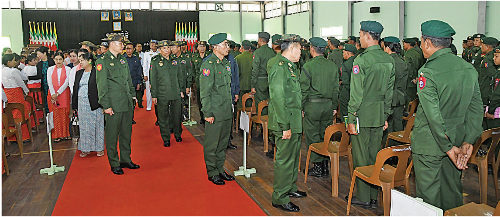
နိုင်ငံတော်စီမံအုပ်ချုပ်ရေးကောင်စီဒုတိယဥက္ကဋ္ဌ ဒုတိယတပ်မတော်ကာကွယ်ရေးဦးစီးချုပ် ကာကွယ်ရေးဦးစီးချုပ်(ကြည်း) ဒုတိယဗိုလ်ချုပ်မှူးကြီးစိုးဝင်း တက်ရောက်လာကြသည့် အရာရှိ၊ စစ်သည်၊ မိသားစုများကို ရင်းရင်းနှီးနှီးလိုက်လံနှုတ်ဆက်စဉ်။

ကျောပုံးမှအဆက် ရှမ်းပြည်နယ်ဝန်ကြီးချုပ် ဦးအောင်အောင်၊ ကာကွယ်ရေးဦးစီးချုပ်ရုံးမှ တပ်မတော် အရာရှိကြီးများ၊ အရှေ့ပိုင်းတိုင်းစစ်ဌာနချုပ် တိုင်းမှူးနှင့်တာဝန်ရှိသူများကလောတပ်နယ် မှ အရာရှိစစ်သည်မိသားစုများ တက်ရောက် ကြသည်။