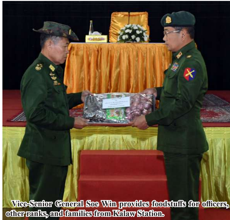
Vice-Senior General Soe Win provides foodstuffs for officers, other ranks, and families from Kalaw Station.

Since taking office, the State Administration Council has imple-