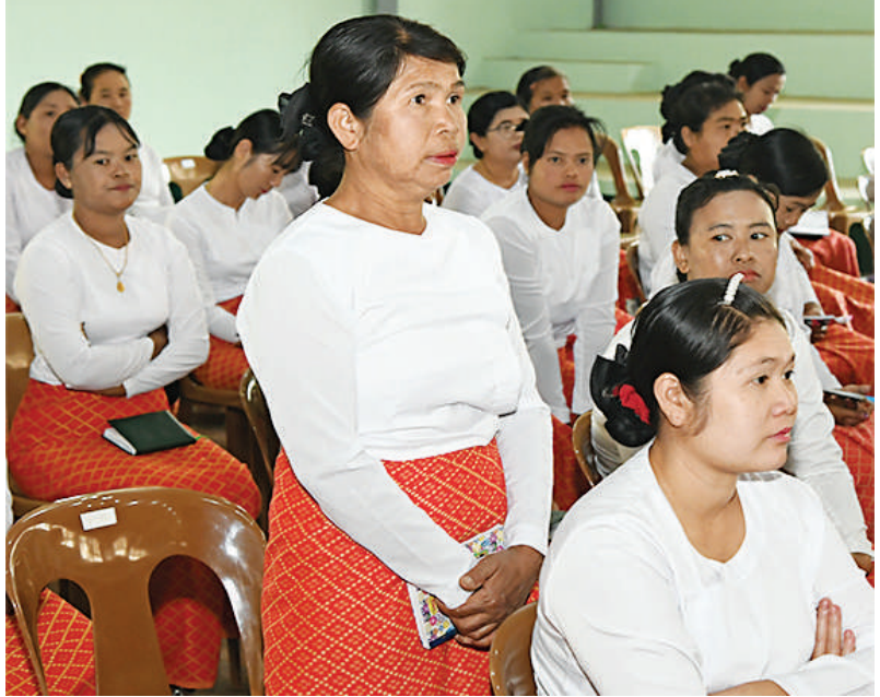
တက်ရောက်လာသည့် ရဲမေတစ်ဦးက တင်ပြစဉ်။

ကြိုးပမ်းဆောင်ရွက်လျက်ရှိသည့် အခြေ အနေများကို ဦးစွာရှင်းလင်းပြောကြားသည်။ ဆက်လက်ပြောကြားရာတွင် တပ်မတော် သားများအနေဖြင့်မည်သူတစ်ဦးတစ်ယောက် ၏တိုက်တွန်းချက်မျှမပါရှိဘဲ နိုင်ငံတော် ကာကွယ်ရေးနှင့် လုံခြုံရေးတာဝန်များကို ထမ်းဆောင်လိုသည့် စိတ်ဆန္ဒများဖြင့် တပ်မတော်အတွင်းသို့ ဝင်ရောက်အမှုထမ်းခဲ့ ကြသူများပီပီ နိုင်ငံတော်၏အချုပ်အခြာ အာဏာတည်တံ့ခိုင်မြဲရေးအတွက် ပေးအပ် လာသည့် မည်သည့်တာဝန်ဝတ္တရားများကို မဆို ကျေပွန်စွာထမ်းဆောင်သွားကြရန်နှင့် တွေ့ကြုံရသည့် အခက်အခဲများကိုလည်း ကြံ့ကြံ့ခံတွန်းလှန်သွားရန်လိုကြောင်း။ နိုင်ငံတော်စီမံအုပ်ချုပ်ရေး ကောင်စီ အနေဖြင့် နိုင်ငံတော်တာဝန်များကို စတင် ထမ်းဆောင်ချိန်ကတည်းကပင် ရှေ့လုပ်ငန်း စဉ်များဦးတည်ချက်များချမှတ်၍ နိုင်ငံဖွံ့ဖြိုး တိုးတက်ရေးကိုအကောင်အထည်ဖော်ဆောင်