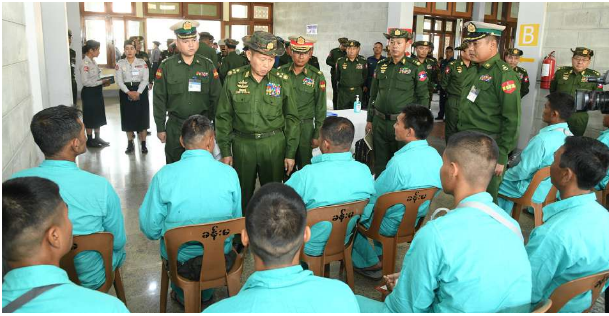
နိုင်ငံတော်စီမံအုပ်ချုပ်ရေးကောင်စီဒုတိယဥက္ကဋ္ဌ ဒုတိယတပ်မတော်ကာကွယ်ရေးဦးစီးချုပ် ကာကွယ်ရေးဦးစီးချုပ်(ကြည်း) ဒုတိယဗိုလ်ချုပ်မှူးကြီးစိုးဝင်း နိုင်ငံတော်ကာကွယ်ရေးနှင့် လုံခြုံရေးတာဝန်များကိုထမ်းဆောင်စဉ် ထိခိုက်ဒဏ်ရာရရှိခဲ့ကြသည့် အရာရှိ၊ စစ်သည်များနှင့် ပြည်သူ့စစ်(ဌာန)တပ်ဖွဲ့ဝင်များ၏ ကျန်းမာရေးတိုးတက်ကောင်းမွန်လာမှုအခြေအနေများကို ရင်းရင်းနှီးနှီးမေးမြန်း အားပေးစကားပြောကြားစဉ်။