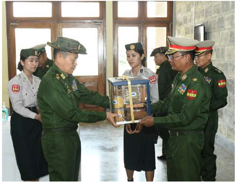
နိုင်ငံတော်စီမံအုပ်ချုပ်ရေးကောင်စီဒုတိယဥက္ကဋ္ဌ ဒုတိယတပ်မတော်ကာကွယ်ရေးဦးစီးချုပ် ကာကွယ်ရေးဦးစီးချုပ်(ကြည်း) ဒုတိယဗိုလ်ချုပ်မှူးကြီးစိုးဝင်း ဆေးရုံတွင် တာဝန်ထမ်းဆောင်လျက်ရှိသည့် ကျန်းမာရေးဝန်ထမ်းများအတွက် လက်ဆောင်ပစ္စည်းများ ချီးမြှင့်ငွေများပေးအပ်စဉ်။