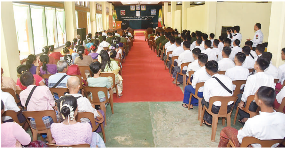
တပ်မတော်အတွင်းမှ အရွယ်မရောက်သေးသူ ကလေးသူငယ်များကို ပြန်လည်နုတ်ထွက်ခွင့်ပြု၍ မိဘများထံလွှဲပြောင်း ပေးအပ်ခြင်း အခမ်းအနားကျင်းပစဉ်။

နေပြည်တော် မတ် ၁၉ ကာကွယ်ရေးဦးစီးချုပ်ရုံး(ကြည်း)နှင့် မြန်မာနိုင်ငံ စောင့်ကြည့်လေ့လာရေးနှင့် အစီရင်ခံတင်ပြရေး လုပ်ငန်းအဖွဲ့တို့၏ အစီအမံဖြင့် တပ်မတော်အတွင်း အရွယ် မရောက်သေးသူ ကလေးသူငယ်များကို သက်ဆိုင်ရာ တိုင်းစစ်ဌာနချုပ်အလိုက် အသေးစိတ်စစ်နုတ်ထွက်ခွင့်ပြုလျက်ရှိ ရာ အသက်မပြည့်စစ်သည် ၉၃ ဦး စစ်ဆေး တွေ့ရှိခဲ့ပြီး အဆိုပါစစ်သည်များအား ၎င်း တို့၏ မိဘများထံသို့ ပြန်လည်လွှဲပြောင်း ပေးအပ်ပွဲအခမ်းအနားကို ယနေ့နံနက်ပိုင်း တွင် ရန်ကုန်မြို့ရှိ စစ်ကြောရေးနှင့် တည်းခိုရေးစခန်း၌ ကျင်းပသည်။ အခမ်းအနားသို့ ကာကွယ်ရေးဦးစီး ချုပ်ရုံး(ကြည်း) စစ်ရေးချုပ်ရုံး တွဲဖက် စစ်ရေးချုပ် ဗိုလ်မှူးချုပ်ရဲရင့်ဝင်းနှင့် တပ်မတော်အရာရှိကြီးများ၊ ကာကွယ်ရေး ဝန်ကြီးဌာန၊ ပြည်ထဲရေးဝန်ကြီးဌာန၊ နိုင်ငံခြားရေးဝန်ကြီးဌာန၊ ဥပဒေရေးရာ ဝန်ကြီးဌာန၊ လူဝင်မှုကြီးကြပ်ရေးနှင့် ပြည်သူ့အင်အားဝန်ကြီးဌာန၊ လူမှုဝန်ထမ်း၊ ကယ်ဆယ်ရေးနှင့်ပြန်လည်နေရာချထား ရေးဝန်ကြီးဌာနတို့မှ ညွှန်ကြားရေးမှူးချုပ် များ၊ ညွှန်ကြားရေးမှူးများ၊ နိုင်ငံတကာ အဖွဲ့အစည်းများဖြစ်ကြသော UNRCO၊ UNICEF၊ UNHCR၊ ILO တို့မှ တာဝန်ရှိ ပုဂ္ဂိုလ်များ၊ ပြန်လည်နုတ်ထွက်ခွင့်ရအသက် မပြည့်စစ်သည် ၉၃ ဦးနှင့် ၎င်းတို့၏ မိဘများ၊ အုပ်ထိန်းသူများ တက်ရောက်