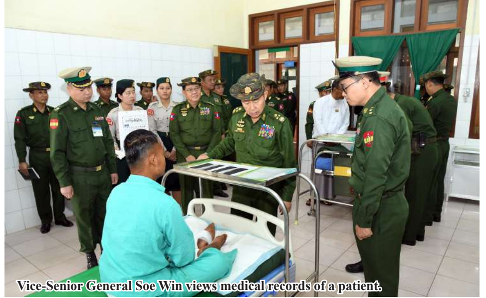
Vice-Senior General Soe Win views medical records of a patient.