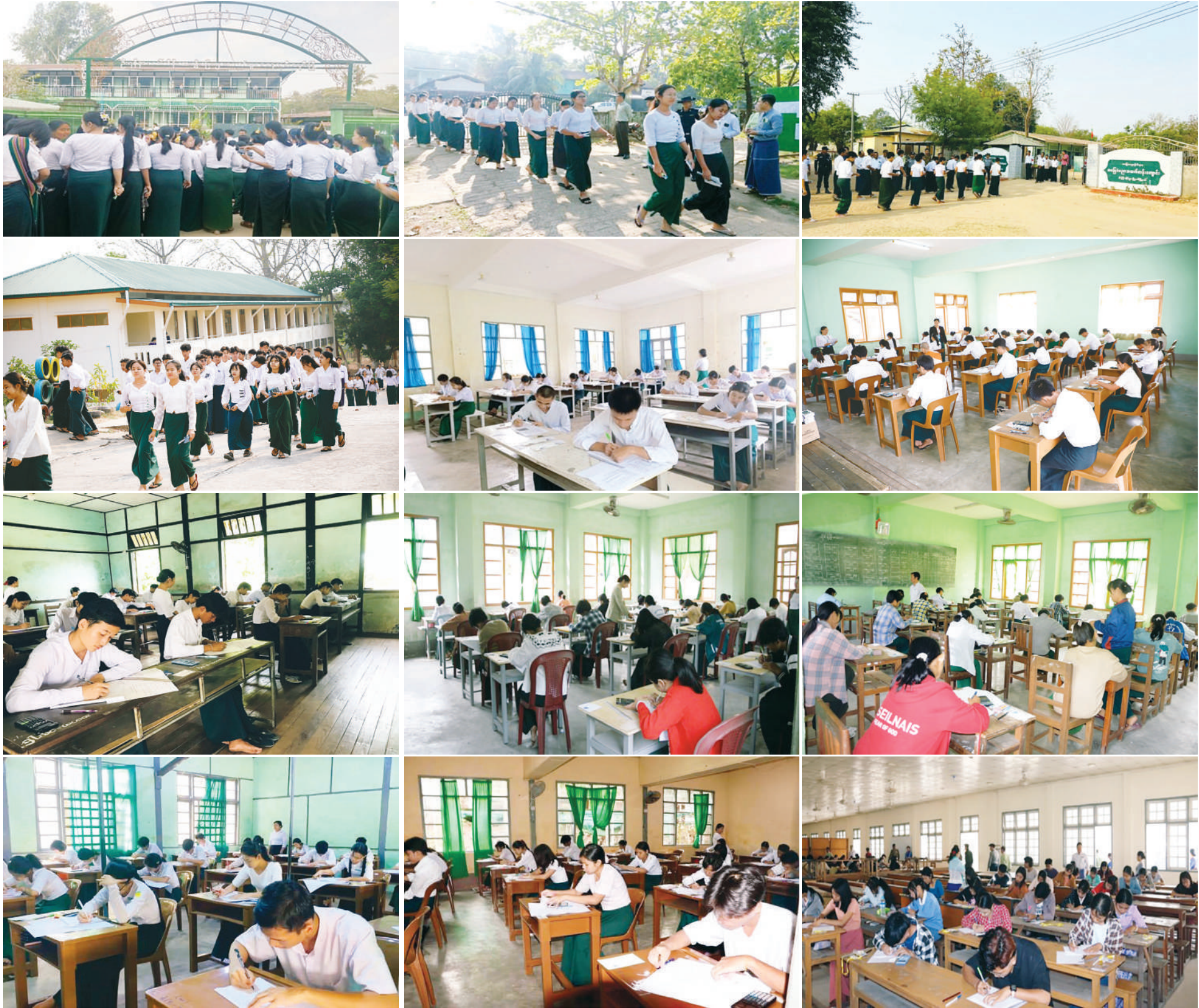
တိုင်းဒေသကြီးနှင့် ပြည်နယ်အသီးသီးရှိ အခြေခံပညာအထက်တန်းကျောင်းများ၌ ကျောင်းသား၊ ကျောင်းသူများက ၂၀၂၄-၂၀၂၅ ပညာသင်နှစ် တက္ကသိုလ်ဝင်စာမေးပွဲ တတိယနေ့တွင် သင်္ချာဘာသာရပ်ကို စိတ်အေးချမ်းသာစွာ ဖြေဆိုနေမှုကို တွေ့ရစဉ်။

နေပြည်တော် မတ် ၁၉ ၂၀၂၄-၂၀၂၅ ပညာသင်နှစ် တက္ကသိုလ်ဝင်စာမေးပွဲကို မတ် ၁၇ ရက်တွင် စတင်ကျင်းပလျက်ရှိရာ ယနေ့တွင် တတိယနေ့အဖြစ် သင်္ချာဘာသာရပ်ကို တိုင်းဒေသကြီးနှင့်ပြည်နယ်အသီးသီးရှိ အခြေခံပညာအထက်တန်းကျောင်းများ၌ ကျောင်းသား၊ ကျောင်းသူများ ဝင်ရောက်ဖြေဆိုလျက်ရှိသည်။ ဦးစွာ စာမေးပွဲဖြေဆိုခြင်းမပြုမီ ဆရာ၊ ဆရာမများက ကျောင်းသား၊ ကျောင်းသူများကို စာမေးပွဲဖြေဆိုခွင့်ကတ်များ မှန်၊ မမှန်စစ်ဆေးခြင်းများနှင့် လိုအပ်သည့် စစ်ဆေးမှုများကို စာမေးပွဲစည်းမျဉ်းစည်းကမ်းများနှင့်အညီ စနစ်တကျဆောင်ရွက်ကြသည်။ ယင်းသို့ကျောင်းသား၊ ကျောင်းသူများ စိတ်အေးချမ်းသာစွာ ဖြေဆိုနိုင်ရေးအတွက် ကျောင်းဝင်းအတွင်းနှင့် အပြင်များ၌ သက်ဆိုင်ရာလုံခြုံရေးအဖွဲ့ဝင်များ၊ ကျန်းမာရေးဝန်ထမ်းများ၊ မီးသတ်တပ်ဖွဲ့ဝင်များနှင့် ရပ်ကွက်၊ ကျေးရွာအုပ်ချုပ်ရေး