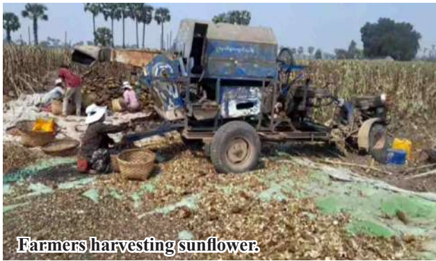
Farmers harvesting sunflower.

Moreover, efforts have been made to support sunflower farmers by providing quality seeds, selling fertilizers at affordable prices, and distributing newly developed sunflower varieties through a farmer-to-farmer exchange system. 206