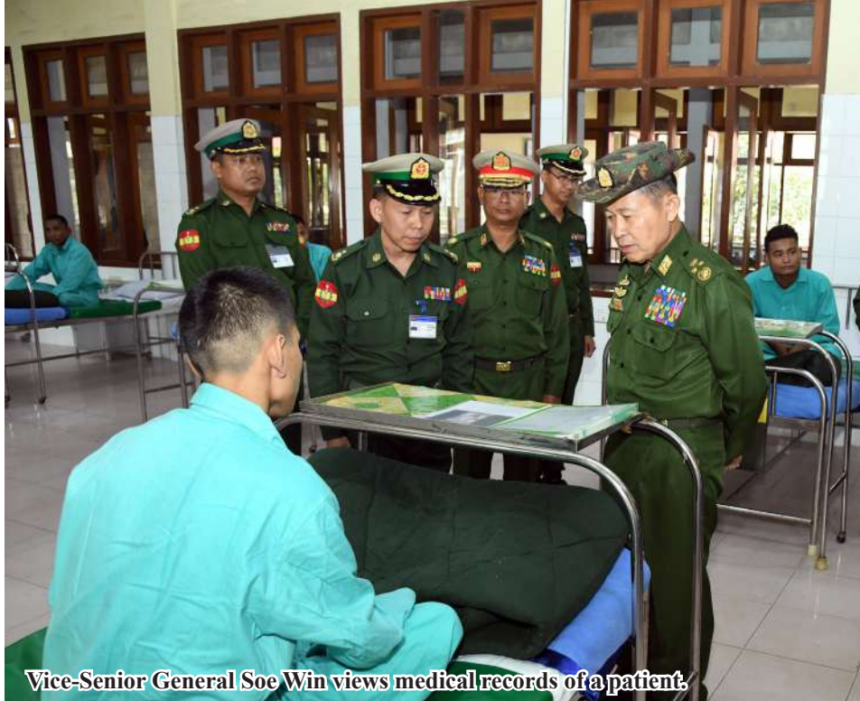
Vice-Senior General Soe Win views medical records of a patient.