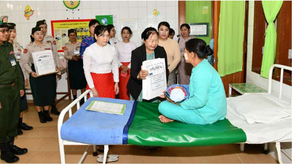
နိုင်ငံတော်စီမံအုပ်ချုပ်ရေးကောင်စီဒုတိယဥက္ကဋ္ဌ ဒုတိယတပ်မတော်ကာကွယ်ရေးဦးစီးချုပ် ကာကွယ်ရေးဦးစီးချုပ်(ကြည်း) ဒုတိယဗိုလ်ချုပ်မှူးကြီးစိုးဝင်း၏ဇနီး ဒေါ်သန်းသန်းနွယ် အမျိုးသမီးနှင့် ကလေးကုသဆောင်တွင် တက်ရောက်ကုသလျက်ရှိသည့် လူနာများကိုလိုက်လံကြည့်ရှုအားပေးစကားပြောကြားပြီး စားသောက်ဖွယ်ရာများပေးအပ်စဉ်။

၂၆ ရှေ့မှအဆက် ဦးစွာ နိုင်ငံတော်စီမံအုပ်ချုပ်ရေးကောင်စီ ဒုတိယဥက္ကဋ္ဌ ဒုတိယတပ်မတော်ကာကွယ်ရေးဦးစီးချုပ် ကာကွယ်ရေးဦးစီးချုပ်(ကြည်း) နှင့်အဖွဲ့ဝင်များသည် အောင်ပန်းမြို့ရှိ နယ်မြေခံတပ်မတော်ဆေးရုံသို့ရောက်ရှိကြ ရာ ဆေးရုံတပ်မှူး၊ တပ်မတော်ပါရဂူများနှင့် ဆေးမှူးများ၊ တာဝန်ရှိသူများက ကြိုဆို နှုတ်ဆက်ကြသည်။ ထို့နောက် နိုင်ငံတော်စီမံအုပ်ချုပ်ရေး ကောင်စီဒုတိယဥက္ကဋ္ဌ ဒုတိယတပ်မတော်