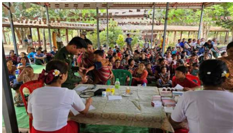
ရန်ကုန်တိုင်းစစ်ဌာနချုပ် နယ်လှည့်ဆေးကုသရေးအဖွဲ့က ဒေသခံပြည်သူများကို ကျန်းမာရေးစောင့်ရှောက်မှုလုပ်ငန်းများ ဆောင်ရွက်ပေးစဉ်။

အရိုးရောဂါ၊ ခွဲစိတ်ကုသမှုဆိုင်ရာရောဂါ၊ ကလေးရောဂါ၊ မျက်စိရောဂါ၊ နား၊ နှာခေါင်း၊ လည်ချောင်းရောဂါ၊ သွားရောဂါ၊ သားဖွားမီးယပ်ရောဂါ၊ အထွေထွေရောဂါများနှင့်ပတ်သက်၍ လိုအပ်သည့် ကျန်းမာရေး စစ်ဆေးကုသပေးခြင်းများ ဆောင်ရွက်ပေးသည်။ ယင်းသို့ ဆောင်ရွက်နေမှုများကို အင်းတိုင်တပ်နယ်မှ တာဝန်ရှိသူများက သွားရောက်ကြည့်ရှုအားပေးပြီး လိုအပ်သည်များ ပေါင်းစပ်ညှိနှိုင်းဆောင်ရွက်ပေးခဲ့ကြောင်း သတင်းရရှိသည်။ (၅၀၁)