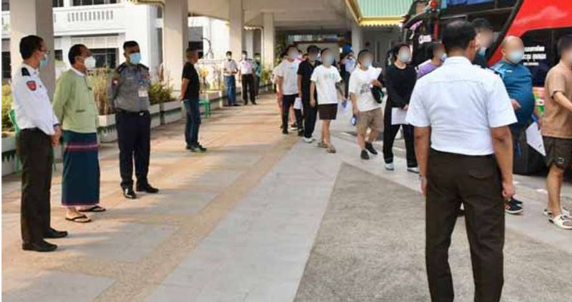
နိုင်ငံတော်အနေဖြင့် နယ်စပ်ဒေသများတွင် ဖြစ်ပေါ်လျက်ရှိသည့် အွန်လိုင်းလိမ်လည်မှု (Telecom Fraud)နှင့် ဒုစရိုက်မှုလုပ်ငန်းများတွင် ဆက်စပ်ပါဝင်ခဲ့ကြသည့် တရုတ်နိုင်ငံသား ဦးရေ ၃၈၀ လွှဲပြောင်းပေးအပ်ခဲ့ပြီး ပြည်ပနိုင်ငံသား ၂၅၆ ဦး ထပ်မံစစ်ဆေးဖော်ထုတ်ထိန်းသိမ်းနိုင်ခဲ့မှု မှတ်တမ်းဓာတ်ပုံ။

နိုင်ငံတော်အစိုးရအနေဖြင့် အွန်လိုင်းလိမ်လည်မှု(Telecom Fraud)နှင့် ဒုစရိုက်မှုလုပ်ငန်းများကို အိမ်နီးချင်းနိုင်ငံများအပါအဝင် နိုင်ငံတကာမှ အဖွဲ့အစည်းများနှင့်ပူးပေါင်း၍ ပြတ်ပြတ်သားသားစုံစမ်းဖော်ထုတ်တိုက်ဖျက်လျက်ရှိပြီး အဆိုပါလုပ်ငန်းများတွင် ဆက်စပ်ပါဝင်ခဲ့ကြသည့် ပြည်ပနိုင်ငံသားများကို သက်ဆိုင်ရာနိုင်ငံများသို့ စနစ်တကျလွှဲပြောင်းပေးလျက်ရှိသည်။