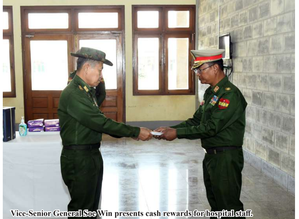
Vice-Senior General Soe Win presents cash rewards for hospital staff.