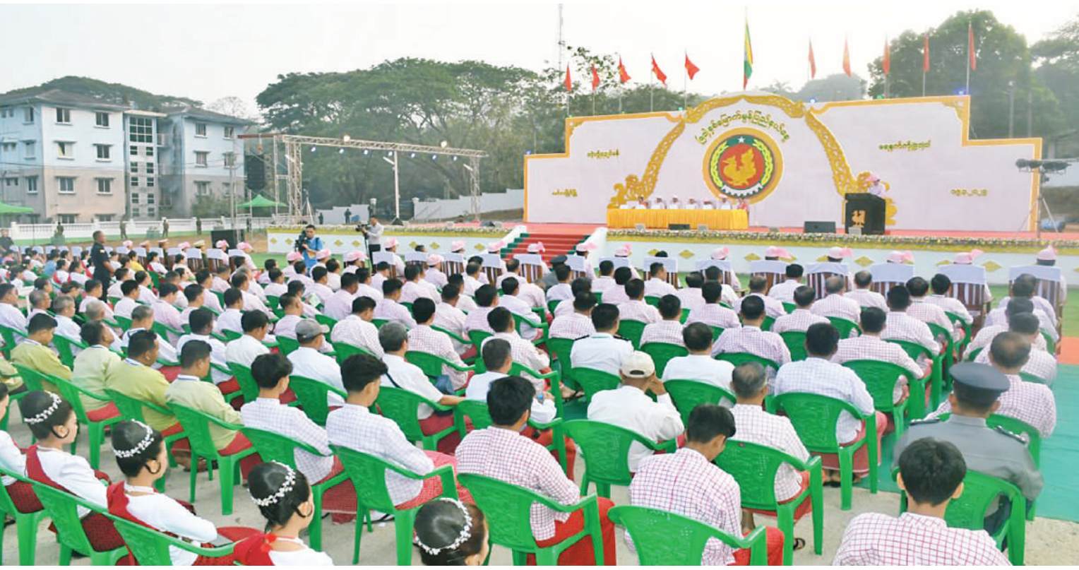
မော်လမြိုင် မတ် ၁၉ ၂၀၂၅ ခုနှစ် ၅၁ နှစ်မြောက် မွန်ပြည်နယ်နေ့အထိမ်းအမှတ် သဝဏ်လွှာဖတ်ကြားခြင်းအခမ်းအနားနှင့် ပြည်နယ်ဂုဏ်ထူးဆောင်ဆုများ ချီးမြှင့်ခြင်းအခမ်းအနားကို ယနေ့နံနက်ပိုင်းတွင် မော်လမြိုင်မြို့၌ ကျင်းပရာ နိုင်ငံတော်စီမံအုပ်ချုပ်ရေးကောင်စီအတွင်းရေးမှူး ဗိုလ်ချုပ်ကြီးအောင်လင်းဒွေး တက်ရောက်ချီးမြှင့်သည်။ ဦးစွာ နိုင်ငံတော်စီမံအုပ်ချုပ်ရေးကောင်စီ အတွင်းရေးမှူး ဗိုလ်ချုပ်ကြီးအောင်လင်းဒွေးသည် မော်လမြိုင်မြို့ သမိန်ဗရမ်း(ဘက်စုံသုံးကွင်း)၌ ကျင်းပသည့် ၅၁ နှစ်မြောက် မွန်ပြည်နယ်နေ့အထိမ်းအမှတ် သဝဏ်လွှာဖတ်ကြားခြင်းအခမ်းအနားသို့ တက်ရောက်သည်။ အဆိုပါအခမ်းအနားသို့ နိုင်ငံတော်စီမံအုပ်ချုပ်ရေးကောင်စီအဖွဲ့ဝင် ပိုးရယ်အောင်သိန်း၊ မန်းငြိမ်းမောင်၊ စာမျက်နှာ ၁၇ ကော်လံ ၁ ၂၆