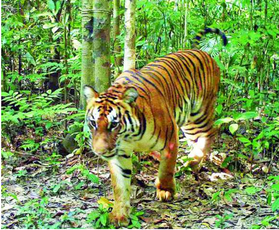
ထမံသီတောရိုင်းတိရစ္ဆာန်ဘေးမဲ့တောအတွင်း ကျက်စားနေသည့်ဘင်္ဂလားကျားကို တွေ့ရစဉ်။

ထမံသီတောရိုင်းတိရစ္ဆာန်ဘေးမဲ့တောကြီးသည် စစ်ကိုင်းတိုင်းဒေသကြီး ခန္တီးမြို့နယ်နှင့် ဟုမ္မလင်းမြို့နယ်တို့အတွင်းတည်ရှိပြီး အကျယ်အဝန်း ၂၅၅၀ ဒသမ ၇၃ စတုရန်းကီလိုမီတာ ကျယ်ဝန်းသည်။ အဆိုပါဘေးမဲ့တောသည် ချင်းတွင်းမြစ်ကြီးဘေးတွင်တည်ရှိပြီး ဥရုချောင်းနှင့်လည်း နီးကပ်သည့်အတွက် တောရိုင်းတိရစ္ဆာန်များ ရှင်သန်ကျက်စားရာ သဘာဝဘေးမဲ့ဥယျာဉ်ကြီးတစ်ခုဖြစ်သည်။