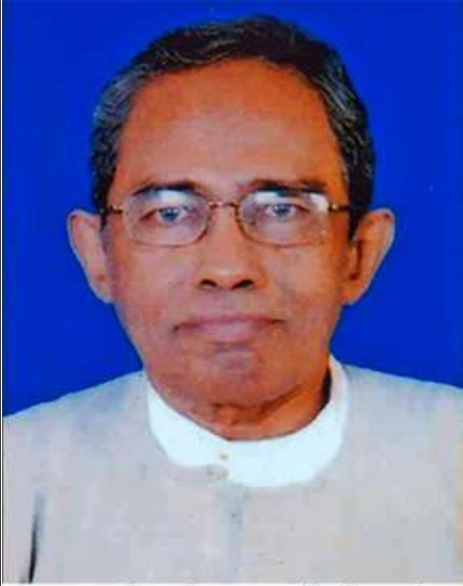
၂၀၁၃ ခုနှစ်၊ အမျိုးသားစာပေ တစ်သက်တာဆုရှင် ဒေါက်တာခင်အေး(မောင်ခင်မင်-ခနုဖြူ)

၁၉၅၉ ခုနှစ်တွင် တက္ကသိုလ်ဝင်တန်းစာမေးပွဲကို မြန်မာတစ်ပြည်လုံးတွင် မြန်မာစာအမှတ်အများဆုံး ဖြင့်အောင်မြင်၍ ငွေတာရီရွှေတံဆိပ်ဆု၊ လှသမိန်ရွှေ တံဆိပ်ဆုများ ချီးမြှင့်ခံခဲ့ရသူလည်းဖြစ်ပါသည်။