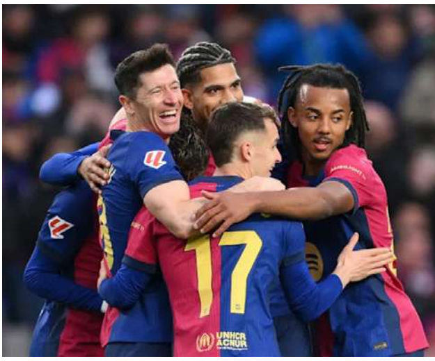
လည်း ချန်ပီယံဖြစ်နိုင်သည့် အခြေ ခန့်မှန်းဖော်ပြထားကြောင်း သိ ရသည်။ Ref : Opta analyst Trs : ML

နှစ် အမှတ်ပေးဆုဖလားကို ရရှိ နိုင်သည်ဟု ခန့်မှန်းခဲ့ခြင်းဖြစ်သည်။ စူပါကွန်ပျူတာ ခန့်မှန်းဖော်ပြ ချက်တွင် ဘာစီလိုနာအသင်း ချန်ပီယံဖြစ်နိုင်သည့် အခြေအနေ မှာ ၆၈ ဒသမ ၅ ရာခိုင်နှုန်းရှိနေပြီး ရိုးရဲလ်မက်ဒရစ်အသင်းအနေဖြင့် ချန်ပီယံဖြစ်နိုင်ခြေမှာ ၂၈ ဒသမ ၅ ရာခိုင်နှုန်းသာ ရှိနေသောကြောင့် ဘာစီလိုနာအသင်းသာ ချန်ပီယံဆု ကို ဆွတ်ခူးနိုင်မည်ဖြစ်ကြောင်း သိရသည်။ ထို့ပြင် အမှတ်ပေးဇယား တတိယနေရာမှ အတိတ်အသင်း သည် ၂၈ ပွဲကစားအပြီးတွင် ၁၆ ပွဲနိုင်၊ ရှစ်ပွဲသရေ၊ လေးပွဲရှုံးရလဒ် ဖြင့် ရမှတ် ၅၆ မှတ်ရရှိထားသော်