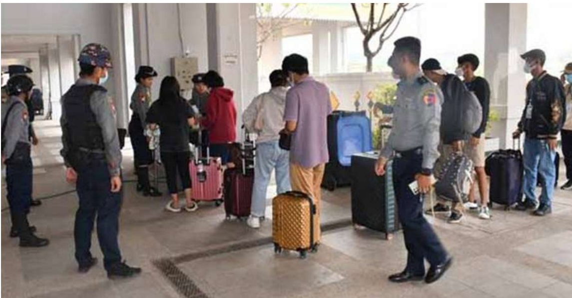
အွန်လိုင်းလိမ်လည်မှု (Telecom Fraud)နှင့် ဒုစရိုက်မူလုပ်ငန်းများတွင် ဆက်စပ်ပါဝင်ခဲ့ကြသည့် အင်ဒိုနီးရှားနိုင်ငံသား ၁၆၉ ဦး၊ ဘင်္ဂလားဒေ့ရှ်နိုင်ငံသား ၁၉ ဦးနှင့် ဂျပန်နိုင်ငံသားတစ်ဦးတို့ကို သက်ဆိုင်ရာနိုင်ငံများသို့ ထပ်မံပြည်နှင့်လွှဲပြောင်းပေးအပ်ခဲ့ပြီး ပြည်ပနိုင်ငံသား ၂၄၂ ဦး ထပ်မံစစ်ဆေးဖော်ထုတ်ထိန်းသိမ်းနိုင်ခဲ့မှု မှတ်တမ်းဓာတ်ပုံ။