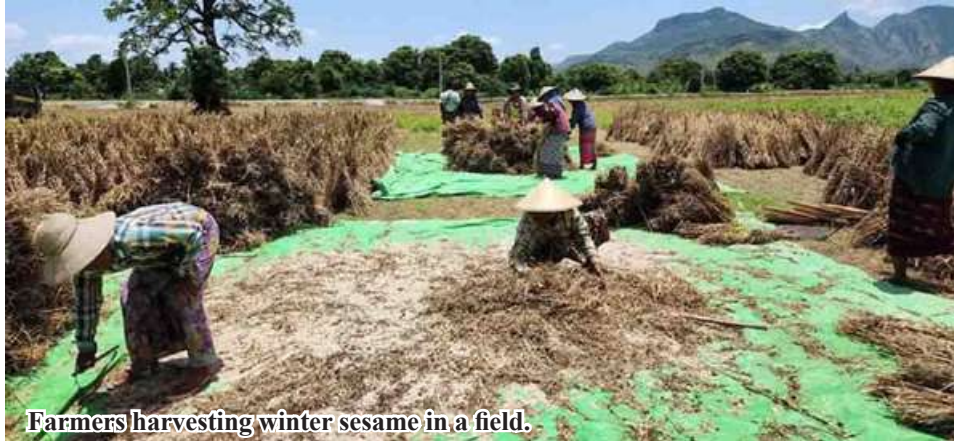
Farmers harvesting winter sesame in a field.

Mawlaik March 18 According to records from the Mawlaik District Agriculture Department, the harvest of 1,473 acres of sesame planted during the winter cropping season has been completed in Mawlaik District, Sagaing Region. During the winter cropping season in Mawlaik District, local farmers planted