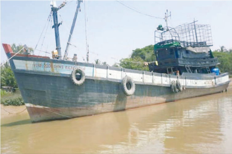
မလေးရှားရေပြင်သို့ စိတ်ပြောင်းဆေးဝါးများသယ်ဆောင်သည့် ရွှေကောင်းသာ စက်လှေအား တွေ့ရစဉ်။