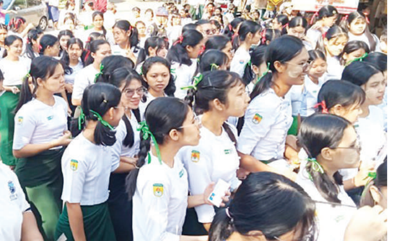
၂၀၂၄-၂၀၂၅ ပညာသင်နှစ် တက္ကသိုလ်ဝင်စာမေးပွဲ ဒုတိယနေ့ အင်္ဂလိပ်စာဘာသာရပ်ဖြေဆိုကြသည့် ကျောင်းသား၊ ကျောင်းသူများကို တွေ့ရစဉ်။

စသဖြင့်ဆက်စပ်ဌာနတွေ အားလုံးပူးပေါင်းပြီး တော့လုံခြုံရေးကအစကျန်းမာရေးကအဆုံး အားလုံးအဆင်ပြေအောင် အစစအရာရာ ပူးပေါင်းဆောင်ရွက်လျက်ရှိကြောင်းပြောကြား လိုပါတယ်။ ကျောင်းသား၊ ကျောင်းသူတွေ အနေနဲ့ စာကိုအေးအေးချမ်းချမ်းနဲ့ကြိုးစား ပြီးတော့ ဖြေကြားဖို့ပြောကြားလိုပါတယ်။