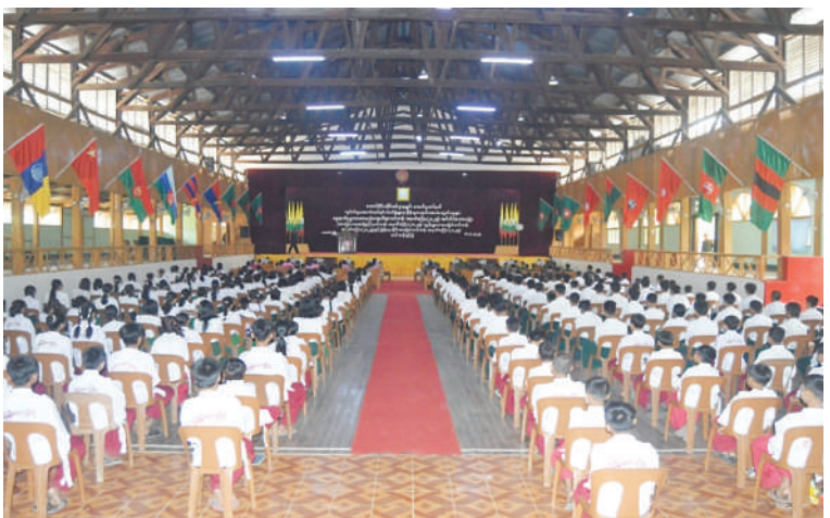
နွေရာသီဗုဒ္ဓဘာသာယဉ်ကျေးလိမ္မာသင်တန်းအမှတ်စဉ်(၁/၂၀၂၅)၊ အင်္ဂလိပ် စကားပြော အခြေခံ၊ အဆင့်မြင့်သင်တန်းအမှတ်စဉ်(၁/၂၀၂၅)၊ ကွန်ပျူတာအခြေခံ သင်တန်းအမှတ်စဉ်(၁/၂၀၂၅)နှင့် မြန်မာ့သိုင်းအခြေခံသင်တန်းအမှတ်စဉ်(၁/၂၀၂၅) ဖွင့်ပွဲများ ကျင်းပစဉ်။

နှုတ်ဆက်ကာ လိုအပ်သည်များ ပေါင်းစပ် ညှိနှိုင်းဆောင်ရွက်ပေးသည်။ အဆိုပါသင်တန်းများတွင် အင်္ဂလိပ် စကားပြော အခြေခံ၊ အဆင့်မြင့်သင်တန်း ကို သင်တန်းသား၊ သင်တန်းသူ ဦးရေ ၆၀ ဖြင့်လည်းကောင်း၊ ကွန်ပျူတာအခြေခံ သင်တန်းကို သင်တန်းသား၊ သင်တန်းသူ ဦးရေ ၄၀ ဖြင့်လည်းကောင်း၊ ဗုဒ္ဓဘာသာ ယဉ်ကျေးလိမ္မာသင်တန်းကို သင်တန်းသား၊ သင်တန်းသူ ဦးရေ ၆၀ နှင့် မြန်မာ့သိုင်း အခြေခံသင်တန်းကို သင်တန်းသား၊ သင်တန်းသူ ဦးရေ ၆၀ တို့ဖြင့်လည်း ကောင်း ဧပြီ ၁၁ ရက်ထိ ဖွင့်လှစ်သင်ကြား ပေးသွားမည်ဖြစ်ကြောင်း သတင်း ရရှိသည်။ (၅၀၁)