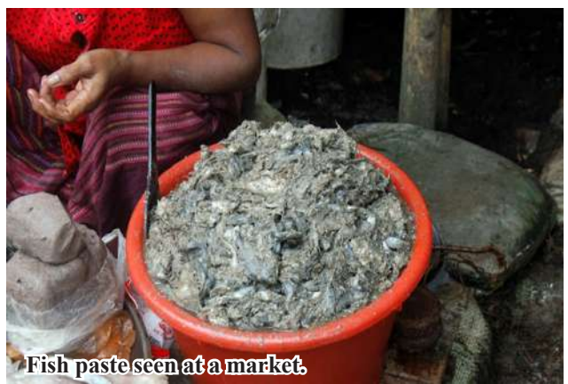
Fish paste seen at a market.

she said. The prices of these fish paste were ranged from 11,000 to 49,000 kyats per viss, depending on the variety. KKL