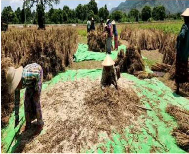
မော်လိုက် မတ် ၃ နှမ်း ရာနှုန်းပြည့် ရိတ်သိမ်းပြီးစီးပြီး စစ်ကိုင်းတိုင်းဒေသကြီး တစ်ကေလျှင် ၁၀ ဒသမ ၄၀ တင်း မော်လိုက်ခရိုင်တွင် ဆောင်းသီးနှံ ထွက်ရှိကြောင်း မော်လိုက်ခရိုင် စိုက်ပျိုးရာသီက စိုက်ပျိုးခဲ့သော စိုက်ပျိုးရေးဦးစီးဌာနမှ သိရသည်။