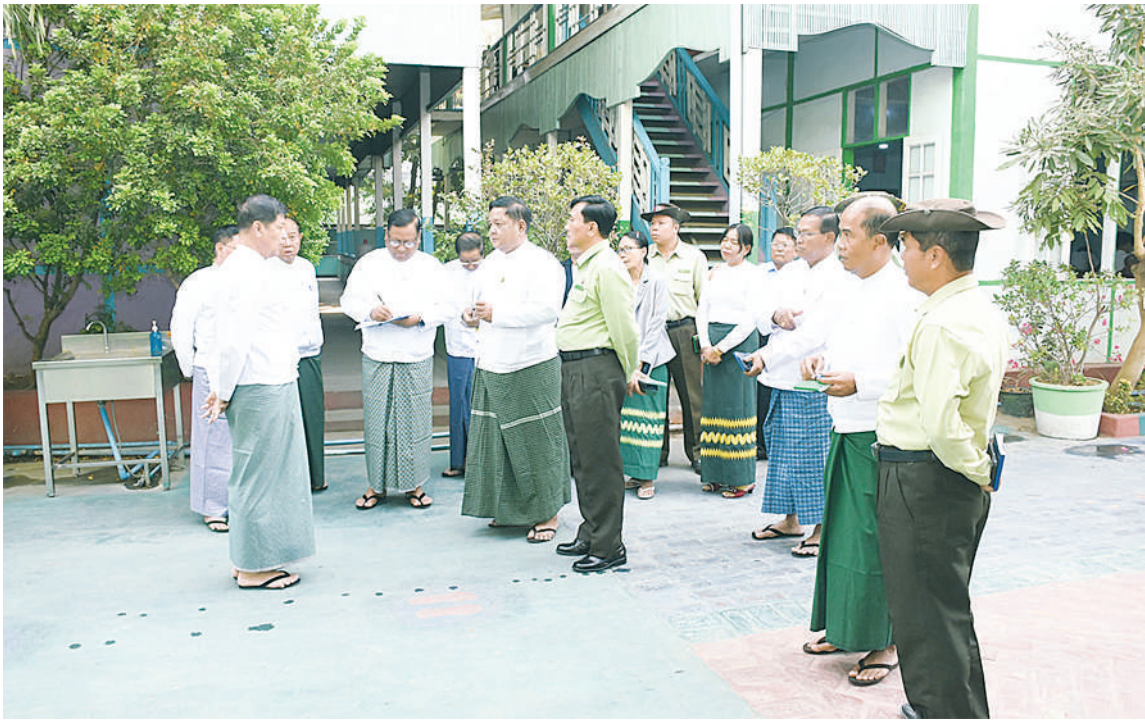
ကျောက်ရှိပြီး တိုင်းဒေသကြီးပညာရေးမှူး၊ တာဝန်ရှိသူများ၊ ကျောင်းအုပ်ကြီးများက ဝန်ကြီးချုပ်က လိုအပ်သည်များကို ပေါင်းစပ်ညှိနှိုင်းဖြည့်ဆည်း ဆောင်ရွက် ရုံးမှ တိုင်းဒေသကြီးပညာရေးမှူးနှင့် ရှင်းလင်းတင်ပြကြရာ တိုင်းဒေသကြီး

မန္တလေး မတ် ၃ ၂၀၂၄-၂၀၂၅ ပညာသင်နှစ် အခြေခံပညာမူလတန်းအဆင့် (Grade-5)နှင့် အလယ်တန်းအဆင့် (Grade-9) ပြီးမြောက်မှုစာမေးပွဲများကို ယနေ့မှ စတင်၍ သက်ဆိုင်ရာစာစစ်ဌာနများတွင် ကျင်းပရာ မန္တလေးတိုင်းဒေသကြီးဝန်ကြီးချုပ် ဦးမျိုးအောင်သည် တိုင်းဒေသကြီးဝန်ကြီးများနှင့် တာဝန်ရှိသူများလိုက်ပါပြီး ယနေ့နံနက်ပိုင်းက စာစစ်ဌာနများတွင် ကျောင်းသား၊ ကျောင်းသူများ အေးချမ်းစွာဖြင့် စာဖြေဆိုနေမှုများကို လိုက်လံကြည့်ရှုသည်။ ထိုသို့ လိုက်လံကြည့်ရှုရာတွင် တိုင်းဒေသကြီးဝန်ကြီးချုပ်နှင့် အဖွဲ့သည် အမှတ်(၁) အခြေခံပညာအထက်တန်းကျောင်း၊ အမှတ်(၄) အခြေခံပညာအထက်တန်းကျောင်း၊ အမှတ်(၈) အခြေခံပညာအထက်တန်းကျောင်းနှင့် အမှတ်(၁၁) အခြေခံပညာအထက်တန်းကျောင်းတို့သို့