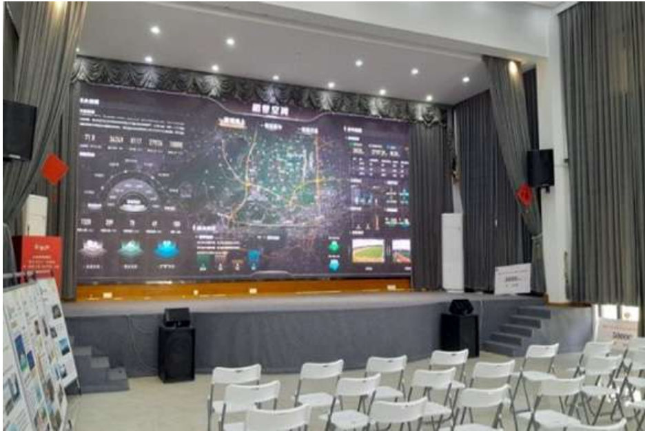
စပါးခင်းများကို ဉာဏ်ရည်အသုံးပြုစောင့်ကြည့်စစ်ဆေးခြင်းစနစ်ဖြင့် စစ်ဆေးခြင်း။

ထိုမြေယာများကို စုပေါင်းစီမံခန့်ခွဲမှုဖြင့် ဆောင်ရွက်သည်။ စုပေါင်းစီမံခန့်ခွဲမှုအောက်မှာ မြေယာများကို သက်ဆိုင်ရာ ကျွမ်းကျင်ပညာရှင်များ ရှိသည့် ကုမ္ပဏီများနှင့် စာချုပ်ချုပ်ဆိုကြသည်။ ကုမ္ပဏီများနှင့် ပူးပေါင်းဆောင်ရွက်ခြင်းဖြင့် နည်းပညာသစ်များကို လက်ခံကျင့်သုံးကြသည်။ မြေယာကို ကောင်းစွာ စီမံခန့်ခွဲနိုင်ပြီး စိုက်ပျိုးမှု၊ ထိန်းသိမ်းမှု၊ ရိတ်သိမ်းမှုတွင် ပိုမိုကောင်းမွန်သော