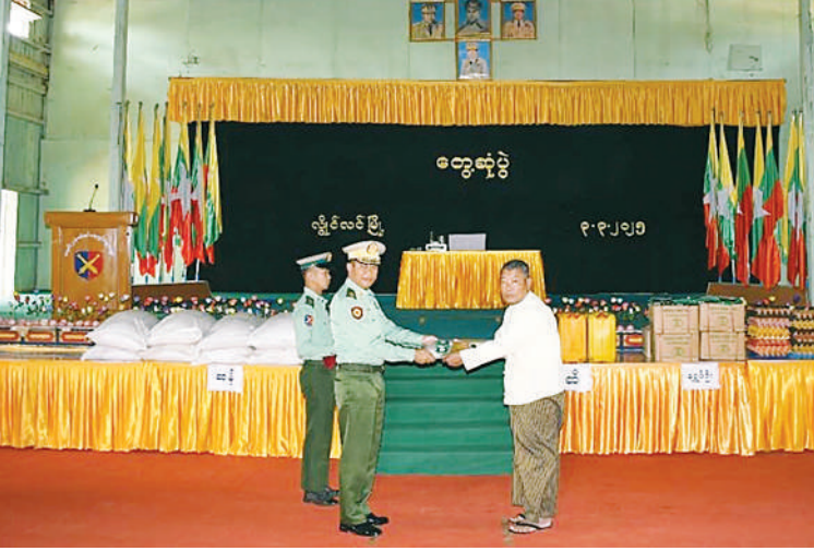
အရှေ့အလယ်ပိုင်းတိုင်းစစ်ဌာနချုပ် တိုင်းမှူး ဗိုလ်ချုပ်မျိုးမင်းထွန်း စစ်မှုထမ်းဟောင်းအဖွဲ့ဝင်များနှင့် မိသားစုဝင်များအတွက် စားသောက်ဖွယ်ရာများ ချီးမြှင့်ပေးအပ်စဉ်။ နေပြည်တော် မတ် ၃ ရှမ်းပြည်နယ်(တောင်ပိုင်း) လွိုင်လင်မြို့ရှိ စစ်မှုထမ်းဟောင်းအဖွဲ့ဝင်များနှင့် မိသားစုဝင်များကို ယနေ့နံနက်ပိုင်းတွင်

ဦးစွာ တိုင်းမှူးက အမှာစကားပြောကြားသည်။ ထို့နောက် စစ်မှုထမ်းဟောင်းအဖွဲ့ဝင်များနှင့် မိသားစုဝင်များ၏တင်ပြချက်များအပေါ် လိုအပ်သည်များ ပေါင်းစပ်ညှိနှိုင်းဆောင်ရွက်ပေးပြီး စစ်မှုထမ်းဟောင်း အဖွဲ့ဝင်များနှင့် မိသားစုဝင်များအတွက် စားသောက်ဖွယ်ရာများ ချီးမြှင့်ပေးအပ်သည်။ ထို့နောက် တိုင်းမှူးနှင့် အဖွဲ့ဝင်များသည် စစ်မှုထမ်းဟောင်းအဖွဲ့ဝင်များနှင့် မိသားစုဝင်များကို နယ်မြေခံဆေးကုသရေးအဖွဲ့က ကျန်းမာရေးစစ်ဆေးကုသပေးခြင်းများ ဆောင်ရွက်ပေးနေမှုများကိုလိုက်လံကြည့်ရှုအားပေးပြီး ဆေးရုံတက်ရောက်ကုသရန်လိုအပ်သည့် လူနာများအား နယ်မြေခံတပ်မတော်ဆေးရုံသို့ တက်ရောက်ကုသနိုင်ရေး လိုအပ်သည်များ ပေါင်းစပ်ညှိနှိုင်းဆောင်ရွက်ပေးခဲ့ကြောင်း သတင်းရရှိသည်။ (၅၀၁)