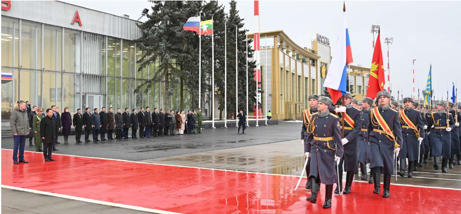
နိုင်ငံတော်စီမံအုပ်ချုပ်ရေးကောင်စီဥက္ကဋ္ဌ နိုင်ငံတော်ဝန်ကြီးချုပ် ဗိုလ်ချုပ်မှူးကြီးမင်းအောင်လှိုင် ရုရှားဖက်ဒရေးရှင်းနိုင်ငံ ဂုဏ်ပြုတပ်ဖွဲ့၏ ချီတက်အလေးပြုခြင်းကို ခံယူစဉ်။

၌ ဂုဏ်ပြုတပ်ဖွဲ့၏အလေးပြုခြင်းကို ခံယူသည်။ ထိုသို့ဆောင်ရွက်စဉ် ဂုဏ်ပြုတပ်ဖွဲ့က နှစ်နိုင်ငံနိုင်ငံတော်သီချင်းများအား တီးမှုတ် ဂုဏ်ပြုအလေးပြုကြသည်။