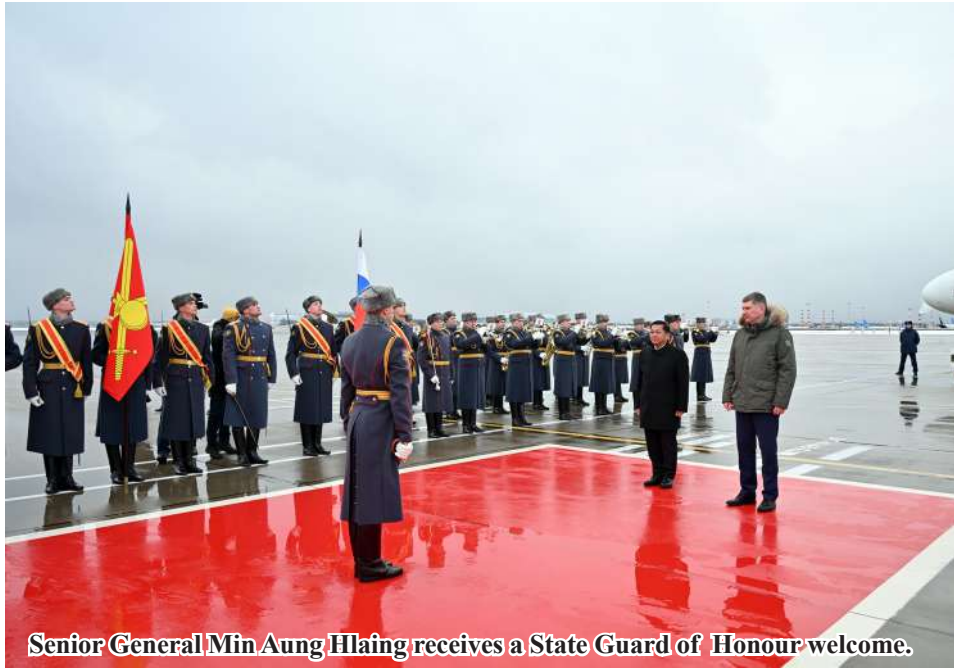
Senior General Min Aung Hlaing receives a State Guard of Honour welcome.