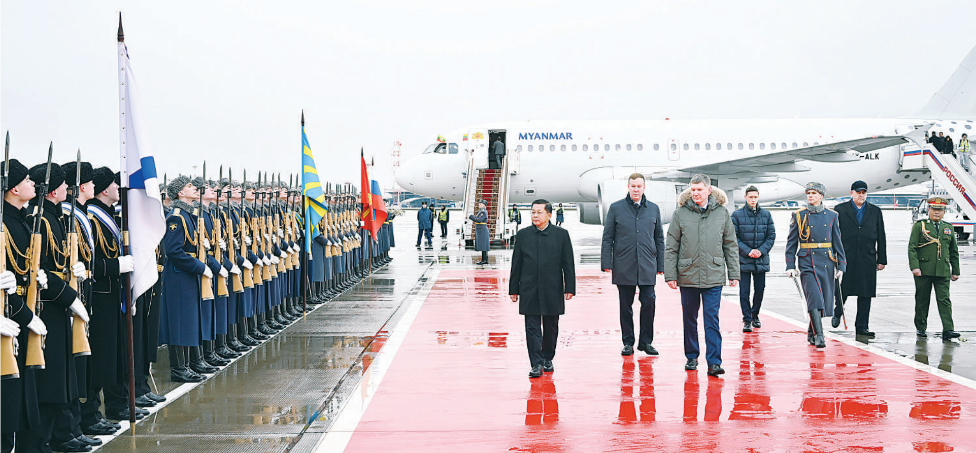
နိုင်ငံတော်စီမံအုပ်ချုပ်ရေးကောင်စီဥက္ကဋ္ဌ နိုင်ငံတော်ဝန်ကြီးချုပ် ဗိုလ်ချုပ်မှူးကြီးမင်းအောင်လှိုင်အား ရုရှားဖက်ဒရေးရှင်းနိုင်ငံ နိုင်ငံတော်ဂုဏ်ပြုတပ်ဖွဲ့က နိုင်ငံတော်အဆင့် ချစ်ကြည်ရေးခရီးစဉ်လာရောက်သည့် နိုင်ငံခေါင်းဆောင်များအား ကြိုဆိုသည့်အစဉ်အလာနှင့်အညီ ဂုဏ်ပြုကြိုဆိုစဉ်။

နေပြည်တော် မတ် ၃ ဖိတ်ကြားချက်အရ တရားဝင်ချစ်ကြည် နိုင်ငံတော်ဝန်ကြီးချုပ် ဗိုလ်ချုပ်မှူးကြီး နံနက်ပိုင်းတွင် အထူးလေယာဉ်ဖြင့် နိုင်ငံတော်စီမံအုပ်ချုပ်ရေးကောင်စီ ရုရှားဖက်ဒရေးရှင်းနိုင်ငံသမ္မတ H.E. | ရေးခရီးစဉ် သွားရောက်ရန်အတွက် နိုင်ငံ မင်းအောင်လှိုင် ဦးဆောင်သည့် မြန်မာ နေပြည်တော် တပ်မတော်လေဆိပ်မှ ဥက္ကဋ္ဌ နိုင်ငံတော်ဝန်ကြီးချုပ် ဦးဆောင် Vladimir Vladimirovich Putin ၏ တော်စီမံအုပ်ချုပ်ရေးကောင်စီ ဥက္ကဋ္ဌ အဆင့်မြင့်ကိုယ်စားလှယ်အဖွဲ့သည် ယနေ့ ထွက်ခွာသည်။ သည့် စာမျက်နှာ ၁၆ ကော်လံ ၁၂