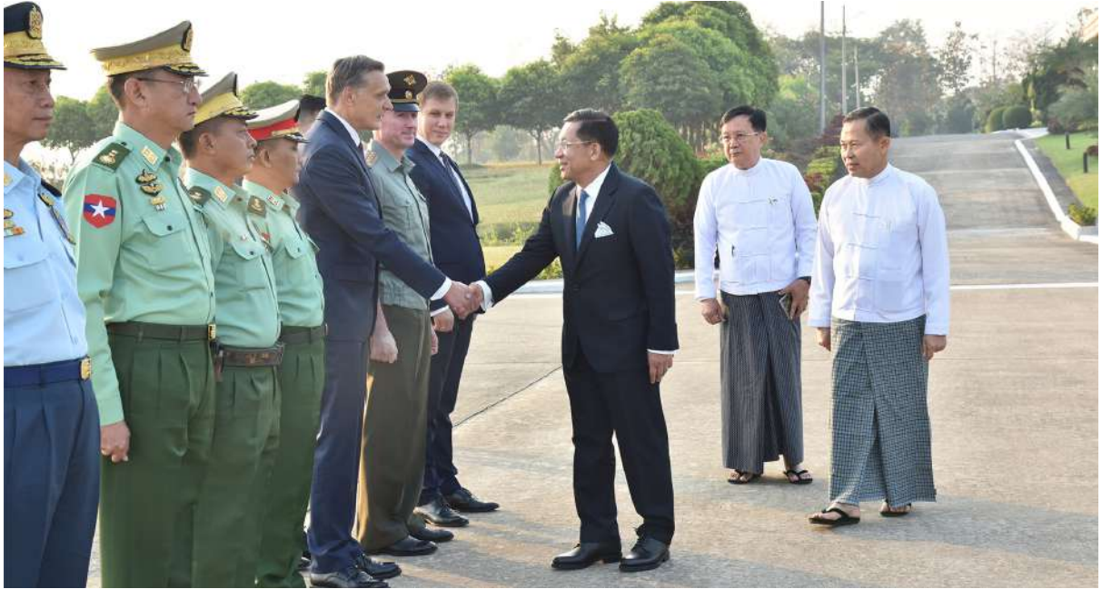
နိုင်ငံတော်စီမံအုပ်ချုပ်ရေးကောင်စီဥက္ကဋ္ဌ နိုင်ငံတော်ဝန်ကြီးချုပ် ဗိုလ်ချုပ်မှူးကြီးမင်းအောင်လှိုင်အား ကောင်စီဒုတိယဥက္ကဋ္ဌ ဒုတိယဝန်ကြီးချုပ် ဒုတိယဗိုလ်ချုပ်မှူးကြီးစိုးဝင်း၊ ကောင်စီအတွင်းရေးမှူး ဗိုလ်ချုပ်ကြီးအောင်လင်းဒွေး၊ ကောင်စီဝင်များ၊ ပြည်ထောင်စုဝန်ကြီးများ၊ ကာကွယ်ရေးဦးစီးချုပ်ရုံး(ကြည်း)မှ အဆင့်မြင့်တပ်မတော်အရာရှိကြီးများ၊ နေပြည်တော်တိုင်းစစ်ဌာနချုပ် တိုင်းမှူး၊ မြန်မာနိုင်ငံဆိုင်ရာ ရုရှားဖက်ဒရေးရှင်းနိုင်ငံ သံရုံး၊ စစ်သံရုံးမှ တာဝန်ရှိသူများက နေပြည်တော်တပ်မတော်လေဆိပ်၌ ပို့ဆောင်နှုတ်ဆက်စဉ်။

ယင်းနောက် နိုင်ငံတော်စီမံအုပ်ချုပ်ရေးကောင်စီဥက္ကဋ္ဌ နိုင်ငံတော်ဝန်ကြီးချုပ် ဦးဆောင်သည့် မြန်မာအဆင့်မြင့်ကိုယ်စားလှယ်အဖွဲ့သည် ဒေသစံတော်ချိန် ညနေပိုင်းတွင် မော်စကိုမြို့ရှိ ဘနကာဘာအပြည်ပြည်ဆိုင်ရာလေဆိပ်သို့ရောက်ရှိကြရာ ရုရှားစီးပွားရေးဖွံ့ဖြိုးတိုးတက်မှုဝန်ကြီး Mr. Maxim Reshetnikov၊ ရုရှားနိုင်ငံခြားရေး