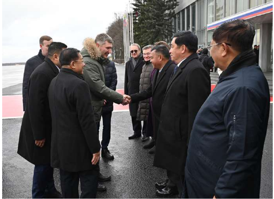
နိုင်ငံတော်စီမံအုပ်ချုပ်ရေးကောင်စီဥက္ကဋ္ဌ နိုင်ငံတော်ဝန်ကြီးချုပ် ဗိုလ်ချုပ်မှူးကြီးမင်းအောင်လှိုင်က ရုရှားစီးပွားရေးဖွံ့ဖြိုးတိုးတက်မှုဝန်ကြီး Mr.Maxim Reshetnikov အား မြန်မာချစ်ကြည်ရေးကိုယ်စားလှယ်အဖွဲ့ဝင်များဖြင့် မိတ်ဆက်ပေးစဉ်။

မြန်မာစစ်သံ(ကြည်း၊ ရေ၊ လေ) ဗိုလ်မှူးချုပ် မိုးကျော်တို့က ကြိုဆိုနှုတ်ဆက်ကြသည်။ လေဆိပ်တွင် နိုင်ငံတော်စီမံအုပ်ချုပ်ရေးကောင်စီဥက္ကဋ္ဌ နိုင်ငံတော်ဝန်ကြီးချုပ် ဗိုလ်ချုပ်မှူးကြီးမင်းအောင်လှိုင်အား ရုရှား