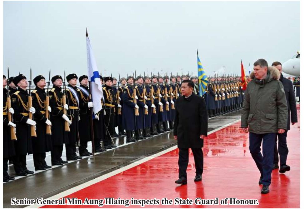
Senior General Min Aung Hlaing inspects the State Guard of Honour.

Nay Pyi Taw March 3 A high-level Myanmar delegation led by Chairman of the State Administration Council Prime Minister Senior General Min Aung Hlaing left Nay Pyi Taw Tatmadaw Airport by special flight this morning to pay an official goodwill visit to Russian Federation at the invitation of President H.E. Vladimir Vladimirovich Putin.