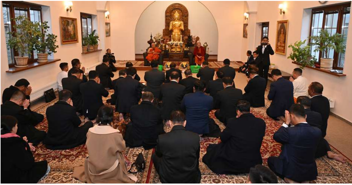
နိုင်ငံတော်စီမံအုပ်ချုပ်ရေးကောင်စီဥက္ကဋ္ဌ နိုင်ငံတော်ဝန်ကြီးချုပ် ဗိုလ်ချုပ်မှူးကြီးမင်းအောင်လှိုင်နှင့် ချစ်ကြည်ရေးကိုယ်စားလှယ်အဖွဲ့ဝင်များ မော်စကိုမြို့ မြန်မာထေရဝါဒဗုဒ္ဓစင်တာ သဒ္ဓမ္မဇောတိကသိမ်တော်အတွင်း၌ ကျောင်းထိုင်ဆရာတော် မဟာသဒ္ဓမ္မဇောတိက ဓဇ ဒေါက်တာ ဘဒ္ဒန္တအစ္စရိယထံမှ ငါးပါးသီလခံယူဆောက်တည်ကြပြီး တရားတော်များ နာယူကြည်ညိုကြစဉ်။

နေပြည်တော် မတ် ၃ ရုရှားဖက်ဒရေးရှင်းနိုင်ငံသို့ တရားဝင် ချစ်ကြည်ရေးခရီးစဉ် ရောက်ရှိနေသည့် နိုင်ငံတော်စီမံအုပ်ချုပ်ရေးကောင်စီ ဥက္ကဋ္ဌ နိုင်ငံတော်ဝန်ကြီးချုပ် ဗိုလ်ချုပ်မှူးကြီး မင်းအောင်လှိုင် ဦးဆောင်သည့် မြန်မာအဆင့်မြင့် ကိုယ်စားလှယ်အဖွဲ့သည် ရုရှားဖက်ဒရေးရှင်းနိုင်ငံဆိုင်ရာ မြန်မာနိုင်ငံသံအမတ်ကြီး ဦးသစ်လင်းအုန်း၊ မြန်မာစစ်သံကြည်း၊ ရေ၊ လေ) တို့လိုက်ပါ၍ ယနေ့ဒေသစံတော်ချိန် ညနေပိုင်းတွင် မော်စကိုမြို့ရှိ မြန်မာထေရဝါဒဗုဒ္ဓစင်တာသို့ သွားရောက်၍ ဆရာတော်များ ဖူးမြော်ကြည်ညိုသည်။ ဦးစွာ နိုင်ငံတော်စီမံအုပ်ချုပ်ရေးကောင်စီ ဥက္ကဋ္ဌ နိုင်ငံတော်ဝန်ကြီးချုပ်နှင့် ချစ်ကြည်ရေး ကိုယ်စားလှယ်အဖွဲ့ဝင်များသည် မော်စကိုမြို့ မြန်မာထေရဝါဒဗုဒ္ဓစင်တာသို့ ရောက်ရှိကြပြီး သဒ္ဓမ္မဇောတိကသိမ်တော်အတွင်း၌ ကျောင်းထိုင်ဆရာတော်မဟာသဒ္ဓမ္မဇောတိက ဓဇ ဒေါက်တာ ဘဒ္ဒန္တအစ္စရိယအား ဖူးမြော်ကြည်ညို၍ သာသနာရေးဆိုင်ရာကိစ္စရပ်များ၊ သီတင်းသုံးနေထိုင်မှုနှင့် သွားလာရေးအခြေအနေများ၊ ထေရဝါဒဗုဒ္ဓစင်တာအတွက် လိုအပ်ချက်များ၊ ရုရှားနိုင်ငံတွင် ထေရဝါဒဗုဒ္ဓသာသနာ ပြန့်ပွားရေးနှင့် ပတ်သက်၍ သာသနာပြုလုပ်ငန်းများဆောင်ရွက်နေမှုအခြေအနေများနှင့် ပတ်သက်၍ မေးမြန်းလျှောက်ထားပြီး လိုအပ်ချက်များကို ဖြည့်ဆည်းဆောင်ရွက်ပေးသည်။ ယင်းနောက် နိုင်ငံတော်စီမံအုပ်ချုပ်ရေးကောင်စီဥက္ကဋ္ဌ နိုင်ငံတော်ဝန်ကြီးချုပ်နှင့် ချစ်ကြည်ရေးခရီးစဉ်တွင် လိုက်ပါလာသည့် အဖွဲ့ဝင်များသည် ဆရာတော်ကြီးထံမှ ငါးပါးသီလခံယူဆောက်တည်ကြပြီး တရားတော်များ နာယူကြည်ညိုကြသည်။ ယင်းနောက် နိုင်ငံတော်စီမံအုပ်ချုပ်ရေးကောင်စီဥက္ကဋ္ဌ နိုင်ငံတော်ဝန်ကြီးချုပ်နှင့် အဖွဲ့ဝင်များသည် ကျောင်းထိုင်ဆရာတော်ကြီးနှင့် သံဃာတော်အရှင်သူမြတ်တို့အား