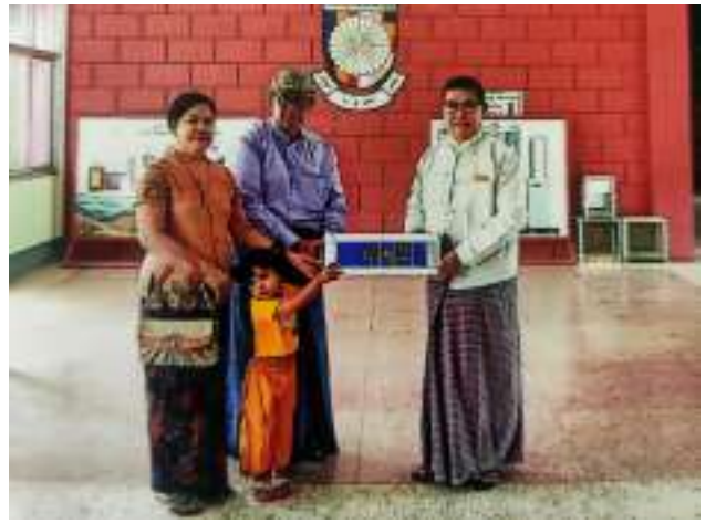
မန္တလေး ချမ်းမြသာစည်မြို့နယ် ကန်တော်ကြီးကန်ပတ်လမ်းရှိ မြို့နယ် ဦးစီးမှူးမှ ရန်ပုံငွေ ထုတ်ချေးပေးပေးခဲ့ကြောင်း သိရသည်။

နတ်မောက် မတ် ၃ ကျေးလက်ဒေသ ဖွံ့ဖြိုးတိုးတက် ထုတ်ချေးရာတွင် လိုက်နာရမည့် ကျေးရွာစီမံကိန်းလုပ်ငန်းအဖွဲ့ဝင် မကွေးတိုင်းဒေသကြီး ရေးဦးစီးဌာန မြို့နယ်ဦးစီးမှူး များက နဘူးကွဲကျေးရွာရှိ မြစ်မီးရောင် မြို့နယ် ဦးစီးဌာန မြစ်မီးရောင် မြို့နယ် ဦးစီးမှူးက မြစ်မီးရောင်ကျေးရွာ စီမံကိန်း ရှင်းလင်းပြောကြားပြီး မြို့နယ် ဦးစီးမှူးက မြစ်မီးရောင်ကျေးရွာ စီမံကိန်းလုပ်ငန်းအဖွဲ့ထံ စီမံကိန်း ရန်ပုံငွေကျပ် ၅၆ ဒသမ ၂ သန်း လွှဲပြောင်းပေးအပ်ခဲ့ကြောင်း သိရသည်။ ကျေးလက်ဒေသ ဖွံ့ဖြိုးတိုးတက် ထုတ်ချေးရာတွင် လိုက်နာရမည့် ကျေးရွာစီမံကိန်းလုပ်ငန်းအဖွဲ့ဝင် မကွေးတိုင်းဒေသကြီး ရေးဦးစီးဌာန မြို့နယ်ဦးစီးမှူး များက နဘူးကွဲကျေးရွာရှိ မြစ်မီးရောင် မြို့နယ် ဦးစီးဌာန မြစ်မီးရောင် မြို့နယ် ဦးစီးမှူးက မြစ်မီးရောင်ကျေးရွာ စီမံကိန်း ရှင်းလင်းပြောကြားပြီး မြို့နယ် ဦးစီးမှူးက မြစ်မီးရောင်ကျေးရွာ စီမံကိန်းလုပ်ငန်းအဖွဲ့ထံ စီမံကိန်း ရန်ပုံငွေကျပ် ၅၆ ဒသမ ၂ သန်း လွှဲပြောင်းပေးအပ်ခဲ့ကြောင်း သိရသည်။ ကျေးလက်ဒေသ ဖွံ့ဖြိုးတိုးတက် ထုတ်ချေးရာတွင် လိုက်နာရမည့် ကျေးရွာစီမံကိန်းလုပ်ငန်းအဖွဲ့ဝင် မကွေးတိုင်းဒေသကြီး ရေးဦးစီးဌာန မြို့နယ်ဦးစီးမှူး များက နဘူးကွဲကျေးရွာရှိ မြစ်မီးရောင် မြို့နယ် ဦးစီးဌာန မြစ်မီးရောင် မြို့နယ် ဦးစီးမှူးက မြစ်မီးရောင်ကျေးရွာ စီမံကိန်း ရှင်းလင်းပြောကြားပြီး မြို့နယ် ဦးစီးမှူးက မြစ်မီးရောင်ကျေးရွာ စီမံကိန်းလုပ်ငန်းအဖွဲ့ထံ စီမံကိန်း ရန်ပုံငွေကျပ် ၅၆ ဒသမ ၂ သန်း လွှဲပြောင်းပေးအပ်ခဲ့ကြောင်း သိရသည်။