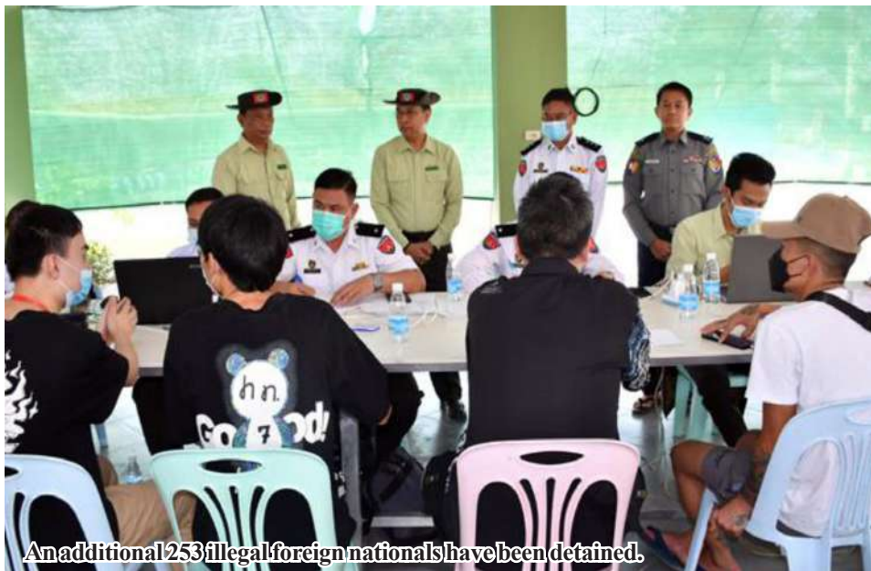
An additional 253 illegal foreign nationals have been detained.