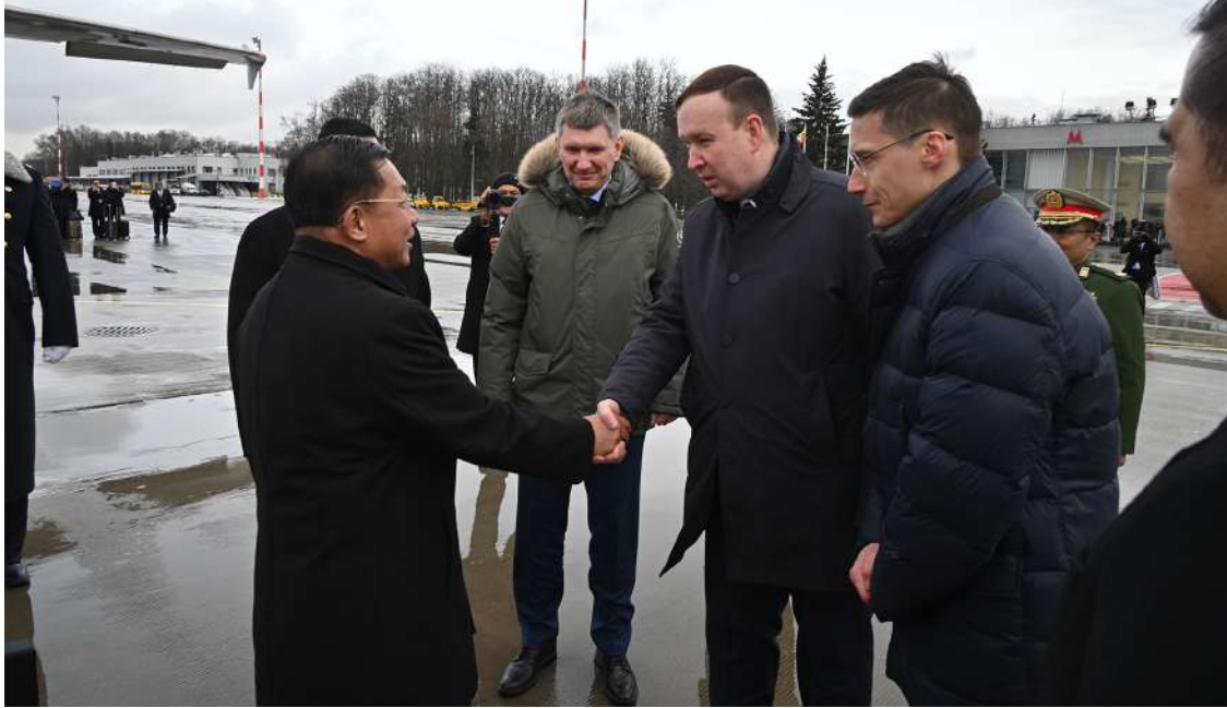
နိုင်ငံတော်စီမံအုပ်ချုပ်ရေးကောင်စီဥက္ကဋ္ဌ နိုင်ငံတော်ဝန်ကြီးချုပ် ဗိုလ်ချုပ်မှူးကြီးမင်းအောင်လှိုင်အား မော်စကိုမြို့ရှိ ဘနကာဘာအပြည်ပြည်ဆိုင်ရာလေဆိပ်၌ ရုရှားစီးပွားရေးဖွံ့ဖြိုးတိုးတက်မှုဝန်ကြီး Mr.Maxim Reshetnikov ၊ ရုရှားနိုင်ငံခြားရေးဝန်ကြီးဌာန ဒုတိယဝန်ကြီးနှင့် တာဝန်ရှိသူများက ကြိုဆိုနှုတ်ဆက်စဉ်။

အဆင့်မြင့် တပ်မတော်အရာရှိကြီးများ၊ ဒုတိယဝန်ကြီးများ၊ စစ်ဘက်၊ နယ်ဘက်မှ တာဝန်ရှိသူများ ခရီးစဉ်တွင်လိုက်ပါသွားကြသည်။ ခရီးစဉ်အတွင်း ရုရှားဖက်ဒရေးရှင်းနိုင်ငံ