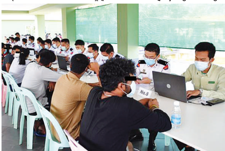
မြန်မာနိုင်ငံအတွင်းသို့ တရားမဝင် ဝင်ရောက်လာသည့် ပြည်ပနိုင်ငံသား ၂၀၈ ဦးကို ထပ်မံဖော်ထုတ်ထိန်းသိမ်းနိုင်ခဲ့မှုတမ်းဓာတ်ပုံ။

နေပြည်တော် မတ် ၁ ထိုင်းနိုင်ငံအပါအဝင် အိမ်နီးချင်းနိုင်ငံ အချို့ကို တစ်ဆင့်ခံဖြတ်သန်း၍ မြန်မာနိုင်ငံအတွင်းသို့ နယ်စပ်လမ်းကြောင်းများမှ တရားမဝင် ဝင်ရောက်လာပြီး ကရင်ပြည်နယ် မြဝတီမြို့-ရွှေကုက္ကိုလ်မယ်ထော်သလေးနှင့် KK Park နယ်မြေများတွင် တရားမဝင် ဝင်ရောက်လာသည့် ပြည်ပနိုင်ငံသား ၂၀၈ ဦးကို ထပ်မံဖော်ထုတ်ထိန်းသိမ်းနိုင်ခဲ့မှုတမ်းဓာတ်ပုံ။