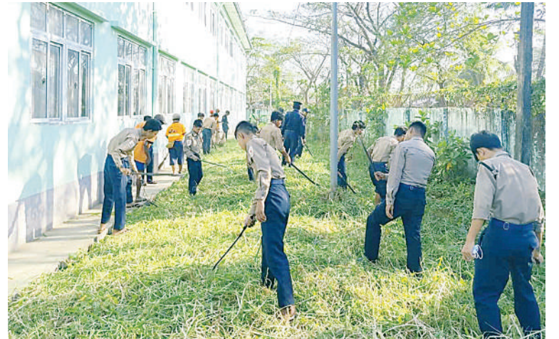
ရန်ကုန်တိုင်းဒေသကြီး အခြေခံပညာကျောင်း၌ နယ်မြေခံတပ်မတော်သားများ၊ မြန်မာနိုင်ငံရဲတပ်ဖွဲ့ဝင်များ၊ မီးသတ်တပ်ဖွဲ့ဝင်များ၊ ကြက်ခြေနီတပ်ဖွဲ့ဝင်များ၊ ဌာနဆိုင်ရာဝန်ထမ်းများ၊ ဒေသခံပြည်သူများနှင့် လူမှုရေးအသင်းအဖွဲ့များက စုပေါင်းသန့်ရှင်းရေးဆောင်ရွက်ပေးစဉ်။ ရွက်ပေးကြသည်။ များက သွားရောက်ကြည့်ရှုအားပေးပြီး ယင်းသို့ ဆောင်ရွက်နေမှုများကို လိုအပ်သည်များ ညှိနှိုင်းဆောင်ရွက်ပေးသက်ဆိုင်ရာ တပ်နယ်များမှ တာဝန်ရှိသူ ခွဲကြကြောင်း သတင်းရရှိသည်။ (၅၀၁)

နေပြည်တော် မတ် ၁ ၂၀၂၄-၂၀၂၅ ပညာသင်နှစ်တွင် တက်ရောက် ပညာသင်ကြားလျက်ရှိသည့် ကျောင်းသား၊ ကျောင်းသူများ အဆင်ပြေချောမွေ့စွာ ပညာသင်ကြားနိုင်ရေးနှင့် စာသင်ကျောင်းများ ဥပစိရုပ်ကောင်းမွန်စေရေးအတွက် တိုင်းဒေသကြီးနှင့် ပြည်နယ်အသီးသီးရှိ အခြေခံပညာကျောင်းများနှင့် တက္ကသိုလ်များတွင် ကျောင်းပတ်ဝန်းကျင် သန့်ရှင်းသာယာလှပရေး လုပ်ငန်းများကို စုပေါင်း ဆောင်ရွက်ပေးလျက်ရှိသည့် အပြင် ပြည်သူ့ဆေးရုံများ၌လည်း စုပေါင်းသန့်ရှင်းရေး ဆောင်ရွက်ပေးလျက်ရှိသည်။ ထိုသို့ဆောင်ရွက်ပေးလျက်ရှိရာ ယနေ့တွင် ရန်ကုန်တိုင်းဒေသကြီး လှိုင်မြို့နယ် အပါအဝင် မြို့နယ် ၁၇ မြို့နယ်ရှိ စာသင်ကျောင်းများ၌ နယ်မြေခံတပ်မတော်သားများ၊ မြန်မာနိုင်ငံရဲတပ်ဖွဲ့ဝင်များ၊ မီးသတ်ဝေဘာဂီမြို့သစ်ရပ်ကွက်ရှိ ဆေးဝါးတပ်ဖွဲ့ဝင်များ၊ ဌာနဆိုင်ရာဝန်ထမ်းများ၊ ဒေသခံပြည်သူများနှင့် လူမှုရေးအသင်းအဖွဲ့များက စာသင်ကျောင်းများ အတွင်း၊ အပြင်ရှိ ချုံနွယ်ပေါင်းမြက်များ ခုတ်ထွင်ရှင်းလင်းခြင်း၊ အမှိုက်များရှင်းလင်းခြင်း၊ ရေစီးရေလာကောင်းမွန်စေရေး ရေနုတ်မြောင်းများ တူးဖော်ပေးခြင်း၊ ရေစည်ရေကန်များတွင် အဘိတ်ဆေးများ ခတ်ပေးခြင်း၊ ခြင်ဆိုင်အောင်းနိုင်သောနေရာများ၌ ခြင်ဆေးဖျန်းပေးခြင်းနှင့် ကျန်းမာရေးအသိပညာပေး လက်ကမ်းစာစောင်များ ပြန့်ဝေပေးခြင်းများကို စုပေါင်းဆောင်ရွက်ပေးကြသည်။ အလားတူ ရန်ကုန်တိုင်းဒေသကြီး ဗိုလ်တထောင်မြို့နယ် အမှတ်(၄)ရပ်ကွက်ရှိ ရန်ကုန်အရှေ့ပိုင်းဆေးရုံ(ဂန္တီဆေးရုံ)၌ လည်းကောင်း၊ မြောက်ဥက္ကလာပမြို့နယ်