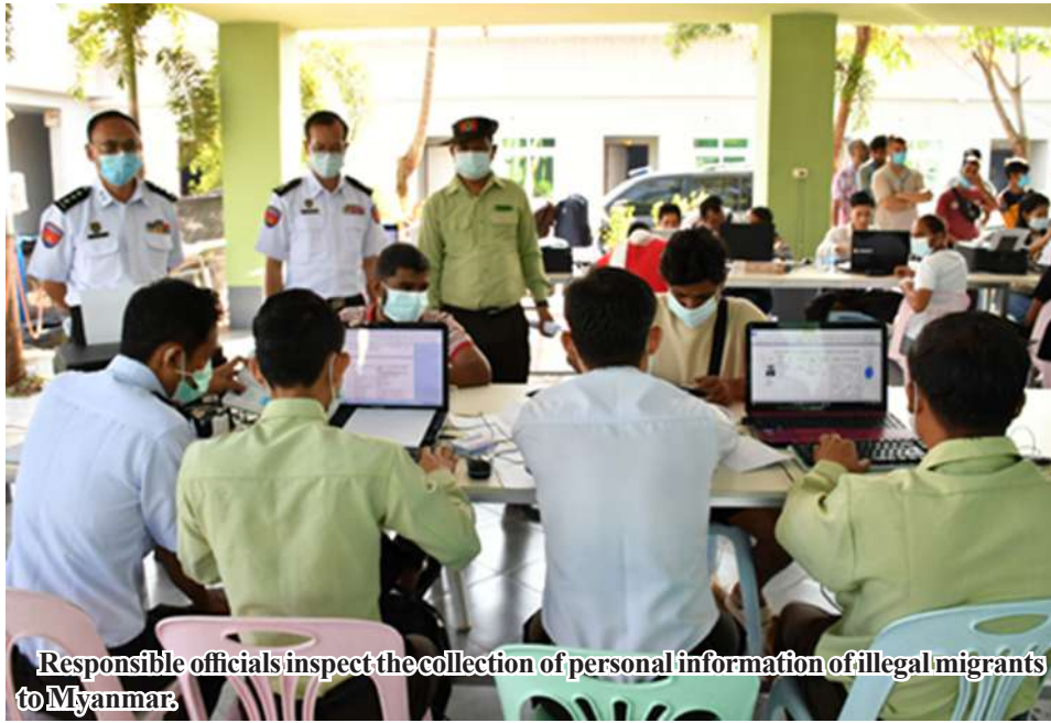
Responsible officials inspect the collection of personal information of illegal migrants to Myanmar

Nay Pyi Taw March 1 The government has been cracking down on illegal migrants involved in online gambling and scams and criminal activities af-