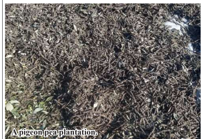
A pigeon pea plantation.