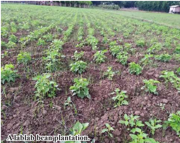
A lablab bean plantation.

Crops grown using the GAP (Good Agricultural Practices) system tend to have better quality compared