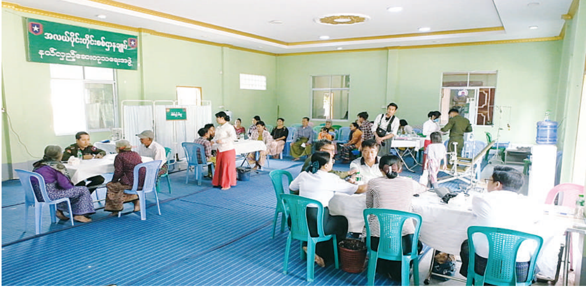
အလယ်ပိုင်းတိုင်းစစ်ဌာနချုပ် နယ်လှည့်ဆေးကုသရေးအဖွဲ့က ဒေသခံပြည်သူများကို ကျန်းမာရေး စောင့်ရှောက်မှုလုပ်ငန်းများ ဆောင်ရွက်ပေးစဉ်။

နေပြည်တော် မတ် ၁ မန္တလေးတိုင်းဒေသကြီး မဟာအောင်မြေမြို့နယ် ရဲမြန်တောင်ရပ်ကွက်ရှိ သံဃာတော်များနှင့် ဒေသခံပြည်သူများကို ယနေ့နံနက်ပိုင်းတွင် အလယ်ပိုင်းတိုင်းစစ်ဌာနချုပ် နယ်လှည့်ဆေးကုသရေးအဖွဲ့က အဆိုပါရပ်ကွက်ရှိ က္လန္တာသယကျောင်းတိုက် သန်းရတနာဓမ္မဗိမာန်၌ ကျန်းမာရေး စောင့်ရှောက်မှုလုပ်ငန်းများ ဆောင်ရွက်ပေးသည်။ ထိုသို့ဆောင်ရွက်ပေးရာတွင် ဆေးကုသရေးအဖွဲ့က သံဃာတော် ၄၁ ပါးနှင့် ဒေသခံပြည်သူ ၁၀၆ ဦးတို့ကို သွေးတိုးရောဂါ၊ အဆစ်အမျက်ရောင်ရောဂါ၊ ဆီးချိုရောဂါ၊ သားဖွားမီးယပ်ရောဂါ၊ အသက်ရှူလမ်းကြောင်းဆိုင်ရာရောဂါ၊ မျက်စိရောဂါ၊ သွားနှင့်ခံတွင်းရောဂါ၊ ခွဲစိတ်ကုသမှုဆိုင်ရာရောဂါ၊ ကလေးရောဂါ၊ အထွေထွေရောဂါတို့နှင့်ပတ်သက်၍ လိုအပ်သည့်ကျန်းမာရေးစစ်ဆေးကုသပေးခြင်းများ ဆောင်ရွက်ပေးပြီး ကျန်းမာရေးအသိပညာပေးဟောပြောဆွေးနွေးခြင်းများ ဆောင်ရွက်ပေးကာ ဆေးရုံတက်ရောက်ကုသရန် လိုအပ်သူများကို နယ်မြေခံတပ်မတော်ဆေးရုံသို့ တက်ရောက်ကုသနိုင်ရေး စီစဉ်ဆောင်ရွက်ပေးသည်။ ယင်းသို့ ဆောင်ရွက်နေမှုများကို မန္တလေးတပ်နယ်မှ တာဝန်ရှိသူများက သွားရောက်ကြည့်ရှုအားပေးပြီး လိုအပ်သည်များ ပေါင်းစပ်ညှိနှိုင်းဆောင်ရွက်ပေးခဲ့ကြောင်း သတင်းရရှိသည်။ (၅၀၁)