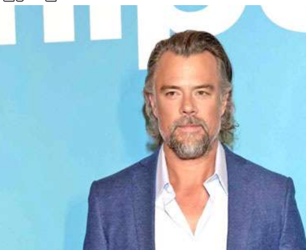
Ref : Russia Today Trs : KKO

နယူးယောက် မတ် ၁ Preschool အမည်ရှိ ဟာသဇာတ်ကားသစ်ကို ဒါရိုက်တာ ဂျိုးဒူဘာမဲ တာဝန်ယူရိုက်ကူးမည်ဖြစ်ကြောင်း ဖေဖော်ဝါရီ ၂၈ ရက် သတင်းများအရ သိရသည်။ ဒါရိုက်တာဂျိုးဒူဘာမဲသည် Preschool ဇာတ်ကားကို ဒါရိုက်တာ အဖြစ် တာဝန်ယူရိုက်ကူးမည့် အပြင် ကိုယ်တိုင်လည်းပါဝင်သရုပ်ဆောင်မည်ဖြစ်သည်။ Preschool ဇာတ်ကား၌ မင်းသားမိုက်ကယ်ဆိုသူ၊ မင်းသမီး အန်ဆိုနီရာသောမတ်နှင့် ချာရ သီပေါတီဖီးတို့ ပါဝင်သရုပ်ဆောင်မည်ဖြစ်သည်။ ASH