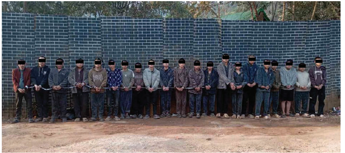
ဖေဖော်ဝါရီ ၉ ရက်တွင် ထပ်မံဖော်ထုတ်ဖမ်းဆီးရမိသည့် တရားမဝင်အွန်လိုင်းလောင်းကစားနှင့် ငွေကြေးလိမ်လည်မှု လုပ်ဆောင်နေသူများကို တွေ့ရစဉ်။

နေပြည်တော် ဖေဖော်ဝါရီ ၁၀ မြန်မာနိုင်ငံအတွင်းသို့ တရားမဝင် ဝင်ရောက်လျက်ရှိသည့် ပြည်ပနိုင်ငံသား များကို စိစစ်ဖော်ထုတ်မှုများ ဆောင်ရွက် ခဲ့ရာ အများစုသည် အိမ်နီးချင်းနိုင်ငံအချို့ ကို တစ်ဆင့်ခံဖြတ်သန်း၍ မြန်မာနိုင်ငံ အတွင်းသို့ ၎င်းတို့၏ကိုယ်ကျိုးစီးပွားများ အတွက် အလုပ်လုပ်ကိုင်ရန် တရားမဝင် ဝင်ရောက်လာကြသူများဖြစ်ကြောင်း တွေ့