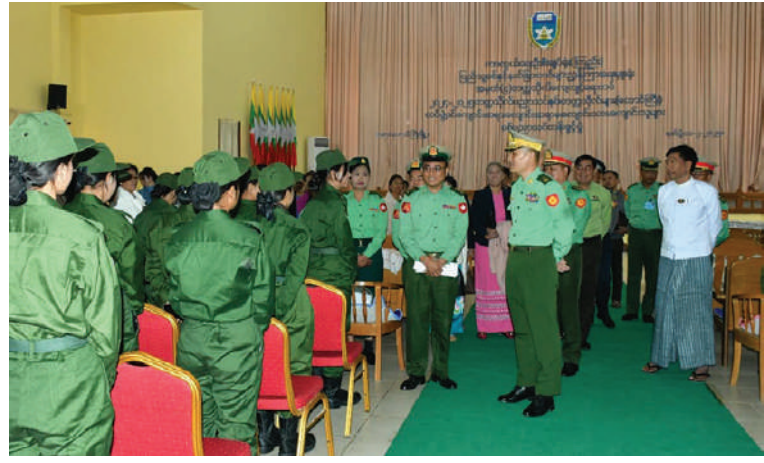
အရှေ့ပိုင်းတိုင်းစစ်ဌာနချုပ် တိုင်းမှူး ဗိုလ်ချုပ်ဇော်မင်းလတ် တက္ကသိုလ် လေ့ကျင့်ရေးတပ်ဖွဲ့ဝင် ဆရာ၊ ဆရာမများနှင့် ကျောင်းသား၊ ကျောင်းသူများကို ရင်းရင်းနှီးနှီးနှုတ်ဆက်စဉ်။

နေပြည်တော် ဖေဖော်ဝါရီ ၁၀ တက္ကသိုလ်များတွင် ပညာသင်ကြား လျက်ရှိသော ကျောင်းသား၊ ကျောင်းသူ များကို အခြေခံစစ်ပညာနှင့် တန်းမြှင့် စစ်ပညာသင်တန်းများ သင်ကြားလေ့ကျင့် ပေးခြင်းဖြင့် နိုင်ငံတော်ကာကွယ်ရေး ဆိုင်ရာ အသိအမြင်များရရှိ၍ အနာဂတ် နိုင်ငံတော်၏ တာဝန်များထမ်းဆောင် သည့်အခါတွင် အထောက်အကူရရှိကာ နိုင်ငံချစ်စိတ်၊ မျိုးချစ်စိတ်များ ပိုမိုရင့်သန် လာစေရန်နှင့် ယုံကြည်ချက်၊ ခံယူချက် မြင့်မားပြီး အရည်အချင်းပြည့်ဝစေရန် ရည်ရွယ်ချက်ဖြင့် ကိုယ်တိုင်ဆန္ဒပြုသည့် တက္ကသိုလ်လေ့ကျင့်ရေးတပ်ဖွဲ့ဝင် ဆရာ၊ ဆရာမများ၊ ကျောင်းသား၊ ကျောင်းသူများ ကို ကာကွယ်ရေးဦးစီးချုပ်ရုံး(ကြည်း) ပြည်သူ့စစ်နှင့်နယ်ခြားတပ်များညွှန်ကြား ရေးမှူးရုံး၏ တက္ကသိုလ်လေ့ကျင့်ရေး တပ်များမှ လေ့ကျင့်ရေးသင်တန်းများ ဖွင့်လှစ်သင်ကြားပေးလျက်ရှိသည်။ ထိုသို့ဖွင့်လှစ်ပေးလျက်ရှိရာ ယနေ့ တွင် ၂၀၂၄-၂၀၂၅ ပညာသင်နှစ် တက္ကသိုလ် လေ့ကျင့်ရေးတပ်ဖွဲ့ဝင်များ အခြေခံ စစ်ပညာသင်တန်းနှင့် တန်းမြှင့်စစ်ပညာ သင်တန်းဖွင့်ပွဲများကို နေပြည်တော် ကောင်စီနယ်မြေတွင် လည်းကောင်း၊ ရှမ်းပြည်နယ်(တောင်ပိုင်း) တောင်ကြီးမြို့ တွင်လည်းကောင်း၊ မွန်ပြည်နယ် မော်လမြိုင်မြို့တွင်လည်းကောင်း၊ ရန်ကုန် တိုင်းဒေသကြီး ကမာရွတ်မြို့နယ်တွင် လည်းကောင်း၊ ဧရာဝတီတိုင်းဒေသကြီး ပုသိမ်မြို့တွင်လည်းကောင်း၊ ပဲခူးတိုင်း ဒေသကြီး တောင်ငူမြို့တွင်လည်းကောင်း နယ်မြေခံသင်တန်းကျောင်းများ၌ ကျင်းပ