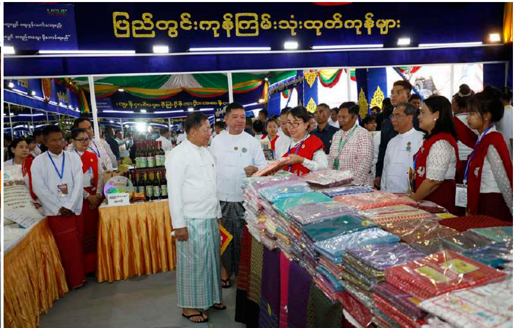
နိုင်ငံတော်စီမံအုပ်ချုပ်ရေးကောင်စီဥက္ကဋ္ဌ နိုင်ငံတော်ဝန်ကြီးချုပ် ဗိုလ်ချုပ်မှူးကြီးမင်းအောင်လှိုင်နှင့်အဖွဲ့ဝင်များ ဝန်ကြီးဌာနပြခန်းများ၊ နေပြည်တော်ကောင်စီ၊ တိုင်းဒေသကြီးနှင့်ပြည်နယ်များ၊ အသင်းအဖွဲ့များ၏ ပြခန်းတစ်ခုချင်းစီအလိုက် စိတ်ပါဝင်စားစွာဖြင့် လိုက်လံကြည့်ရှုစဉ်။

ပြခန်း၊ ပြည်ထောင်စုနယ်မြေ နေပြည်တော် MSME ထုတ်ကုန်ပြခန်း၊ ကချင်ပြည်နယ် MSME ထုတ်ကုန်ပြခန်း၊ ကယားပြည်နယ် MSME ထုတ်ကုန်ပြခန်း၊ ကရင်ပြည်နယ် MSME ထုတ်ကုန်ပြခန်း၊ ချင်းပြည်နယ် MSME ထုတ်ကုန်ပြခန်း၊ စစ်ကိုင်းတိုင်းဒေသကြီး MSME ထုတ်ကုန်ပြခန်း၊ တနင်္သာရီတိုင်းဒေသကြီး MSME ထုတ်ကုန်ပြခန်း၊ ပဲခူးတိုင်းဒေသကြီး MSME ထုတ်ကုန်ပြခန်း၊ မကွေး