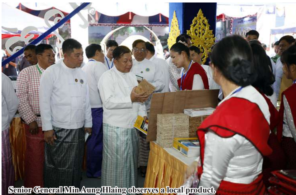
Senior General Min Aung Hlaing observes a local product.