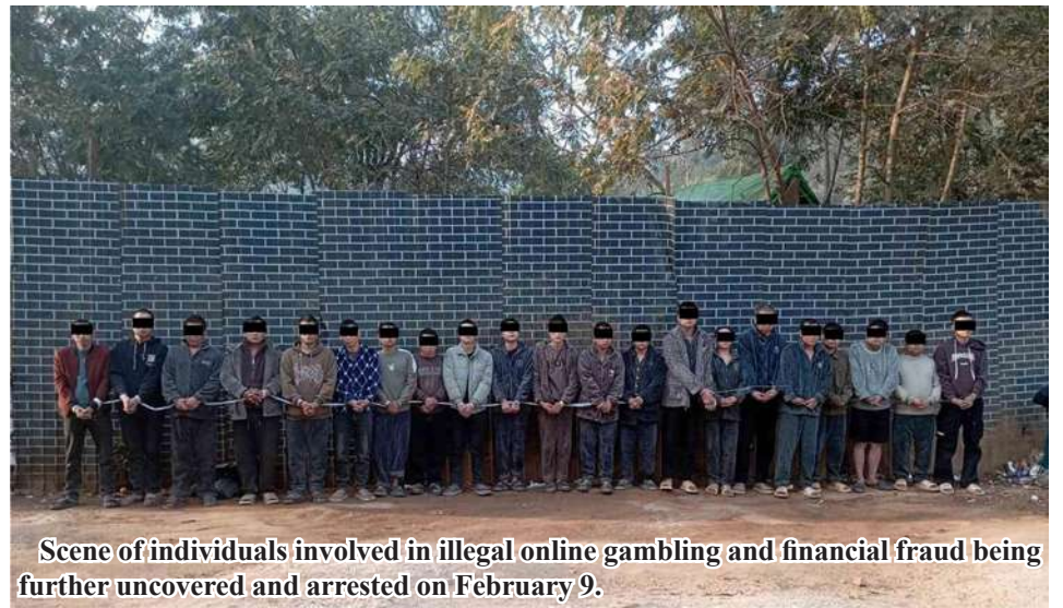
Scene of individuals involved in illegal online gambling and financial fraud being further uncovered and arrested on February 9.