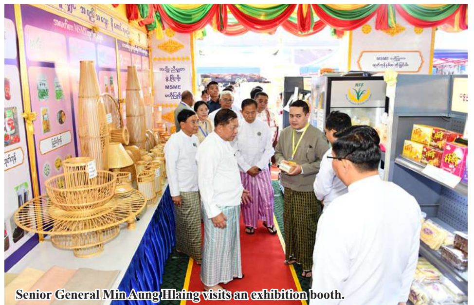
Senior General Min Aung Hlaing visits an exhibition booth.