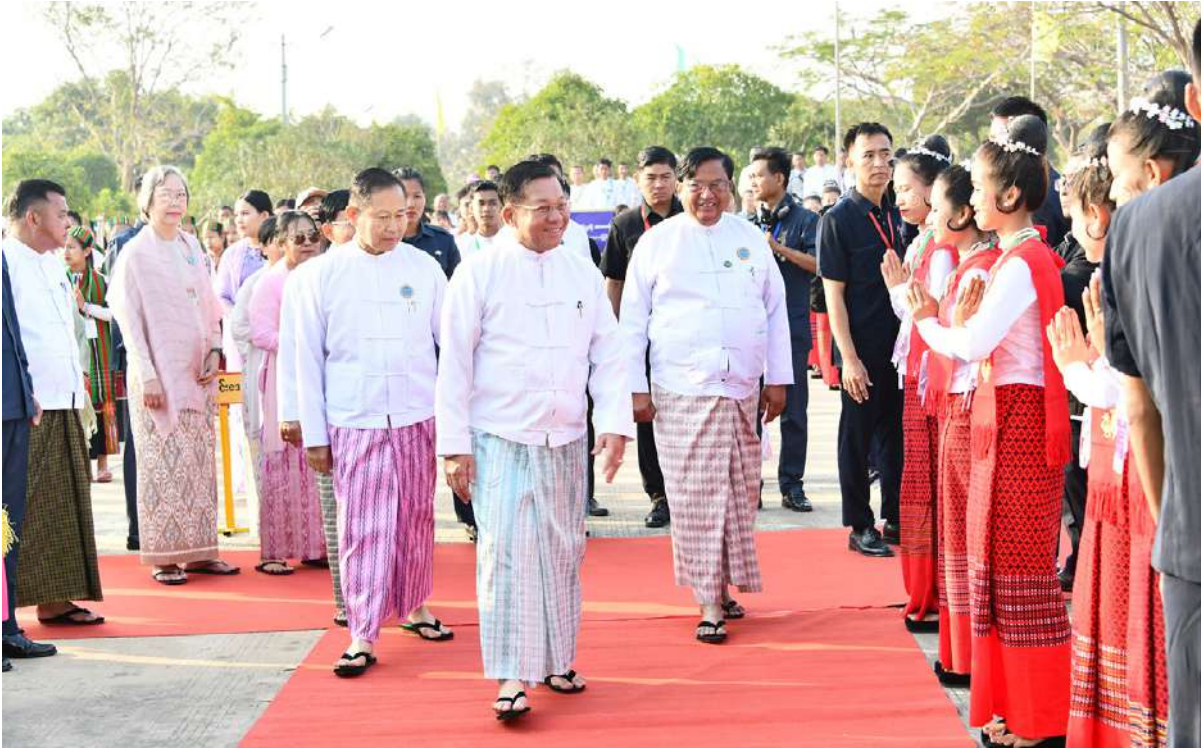
နိုင်ငံတော်စီမံအုပ်ချုပ်ရေးကောင်စီဥက္ကဋ္ဌ နိုင်ငံတော်ဝန်ကြီးချုပ် ဗိုလ်ချုပ်မှူးကြီးစိုးဝင်းအောင်လှိုင်နှင့်အဖွဲ့ဝင်များအား တိုင်းရင်းသားမောင်မယ်များနှင့်ဒေသခံပြည်သူများက ရင်းရင်းနှီးနှီးနှုတ်ဆက်စဉ်။

ယင်းနောက် နိုင်ငံတော်စီမံအုပ်ချုပ်ရေးကောင်စီဥက္ကဋ္ဌ နိုင်ငံတော်ဝန်ကြီးချုပ်က ပြည်ထောင်စုအဆင့် MSME ထုတ်ကုန်ပြပွဲနှင့်ပြိုင်ပွဲဖွင့်ပွဲအခမ်းအနားကို စက်ခလုတ်