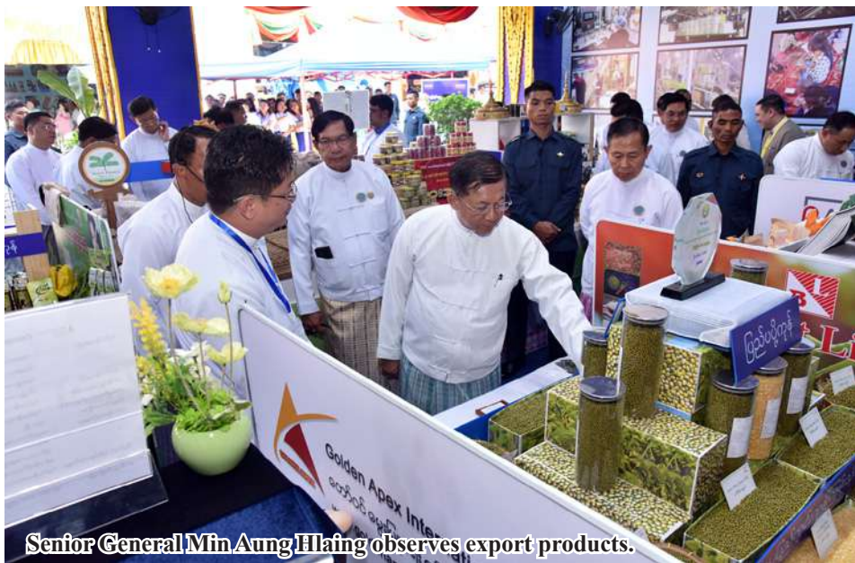
Senior General Min Aung Hlaing observes export products.