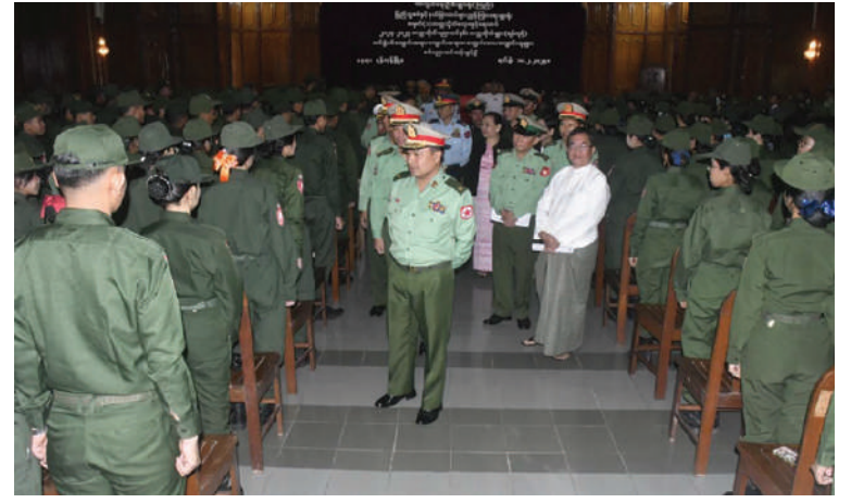
ရန်ကုန်တိုင်းစစ်ဌာနချုပ် တိုင်းမှူး ဗိုလ်မှူးချုပ်ပြည့်စုံလင်း တက္ကသိုလ် လေ့ကျင့်ရေးတပ်ဖွဲ့ဝင် ဆရာ၊ ဆရာမများနှင့် ကျောင်းသား၊ ကျောင်းသူများကို ရင်းရင်းနှီးနှီးနှုတ်ဆက်စဉ်။

ပြုလုပ်ကြသည်။ အဆိုပါ သင်တန်းဖွင့်ပွဲများသို့ သက်ဆိုင်ရာ တိုင်းစစ်ဌာနချုပ်များမှ တိုင်းမှူးများ၊ ကာကွယ်ရေးဦးစီးချုပ်ရုံး (ကြည်း) ပြည်သူ့စစ်နှင့်နယ်ခြားတပ်များ ညွှန်ကြားရေးမှူးရုံး ညွှန်ကြားရေးမှူး၊ ဌာနဆိုင်ရာတာဝန်ရှိသူများ၊ တက္ကသိုလ် အသီးသီးမှ ပါမောက္ခချုပ်များ၊ တက္ကသိုလ် လေ့ကျင့်ရေးတပ်ဖွဲ့ဝင် ဆရာ၊ ဆရာမများ၊ သင်တန်းတာဝန်ခံ အရာရှိများ၊ သင်တန်း ဆရာ၊ ဆရာမများနှင့် ကျောင်းသား၊ ကျောင်းသူများ တက်ရောက်ကြပြီး တိုင်းမှူးများနှင့် တာဝန်ရှိသူကအဖွင့်အမှာ စကားများ အသီးသီးပြောကြားကြသည်။ ထို့နောက် တိုင်းမှူးများနှင့် တက် ရောက်လာကြသူများက သက်ဆိုင်ရာ တိုင်းဒေသကြီးနှင့် ပြည်နယ်များရှိ တက္ကသိုလ် လေ့ကျင့်ရေးတပ်ဖွဲ့ဝင်