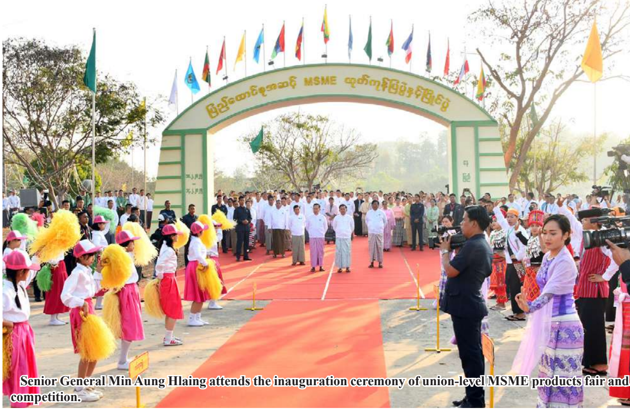
Senior General Min Aung Hlaing attends the inauguration ceremony of union-level MSME products fair and competition.

Nay Pyi Taw February 10 Inauguration ceremony of union-level MSME products fair and competition was held at Taboung grounds, Uppatasanti Pagoda here this morning, formally opened