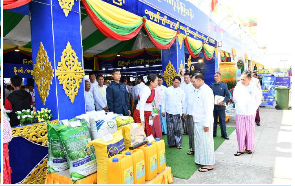
နိုင်ငံတော်စီမံအုပ်ချုပ်ရေးကောင်စီဥက္ကဋ္ဌ နိုင်ငံတော်ဝန်ကြီးချုပ် ဗိုလ်ချုပ်မှူးကြီးမင်းအောင်လှိုင်နှင့်အဖွဲ့ဝင်များ ဝန်ကြီးဌာနပြခန်းများ၊ နေပြည်တော်ကောင်စီ၊ တိုင်းဒေသကြီးနှင့်ပြည်နယ်များ၊ အသင်းအဖွဲ့များ၏ ပြခန်းတစ်ခုချင်းစီအလိုက် စိတ်ပါဝင်စားစွာဖြင့် လိုက်လံကြည့်ရှုစဉ်။