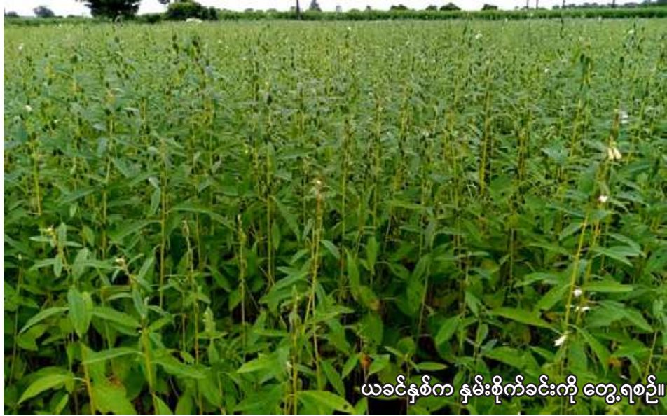
ယခင်နှစ်က နှမ်းစိုက်ခင်းကို တွေ့ရစဉ်။

ရွှေဘို ဖေဖော်ဝါရီ ၁၀ စစ်ကိုင်းတိုင်းဒေသကြီး ရွှေဘိုခရိုင်တွင် နွေသီးနှံစိုက်ပျိုး ရာသီ၌ နှမ်း ၇၁၇၇၇ ဧကစိုက်ပျိုး သွားမည်ဖြစ်ကြောင်း ရွှေဘိုခရိုင် စိုက်ပျိုးရေးဦးစီးဌာနမှ သိရသည်။ ရွှေဘိုခရိုင်တွင် နွေသီးနှံစိုက် ပျိုးရာသီ၌ နှမ်းစိုက်ပျိုးရန်အတွက် မြို့နယ်အလိုက်လျာထားမှု အနေ