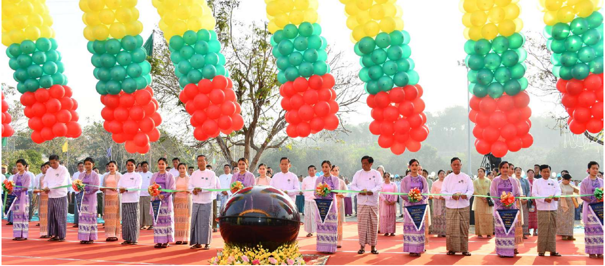
နိုင်ငံတော်စီမံအုပ်ချုပ်ရေးကောင်စီ ဒုတိယဥက္ကဋ္ဌ ဒုတိယဝန်ကြီးချုပ် ဒုတိယဗိုလ်ချုပ်မှူးကြီးစိုးဝင်း၊ ပြည်ထောင်စုဝန်ကြီးများဖြစ်ကြသည့် ဦးဝင်းရှိန်၊ ဦးမင်းနောင်၊ ဦးလှမိုး၊ ဒေါက်တာချာလီသန်း၊ ဒေါက်တာမျိုးသိမ်းကျော်နှင့် နေပြည်တော်ကောင်စီဥက္ကဋ္ဌ ဦးသန်းထွန်းဦးတို့က ပြည်ထောင်စုအဆင့် MSME ထုတ်ကုန်ပြပွဲနှင့်ပြိုင်ပွဲ ဖွင့်ပွဲအခမ်းအနားကို ဖဲကြိုးဖြတ်ဖွင့်လှစ်ပေးစဉ်။

ထို့နောက် ဖွင့်ပွဲအခမ်းအနားအပြီးတွင် နိုင်ငံတော် စီမံအုပ်ချုပ်ရေးကောင်စီဥက္ကဋ္ဌ နိုင်ငံတော်ဝန်ကြီးချုပ်သည် အဖွဲ့ဝင်များနှင့်အတူ စက်မှုဝန်ကြီးဌာနပြခန်း၊ စိုက်ပျိုးရေး၊ မွေးမြူရေးနှင့် ဆည်မြောင်းဝန်ကြီးဌာနပြခန်း၊ သမဝါယမနှင့်ကျေးလက်ဖွံ့ဖြိုးရေးဝန်ကြီးဌာနပြခန်း၊ သယံဇာတနှင့်သဘာဝပတ်ဝန်းကျင်ထိန်းသိမ်းရေး ဝန်ကြီးဌာနပြခန်း၊ စီးပွားရေးနှင့်ကူးသန်းရောင်းဝယ်ရေးဝန်ကြီးဌာနပြခန်း၊ သိပ္ပံနှင့် နည်းပညာဝန်ကြီးဌာနပြခန်း၊ ကျန်းမာရေးဝန်ကြီးဌာန