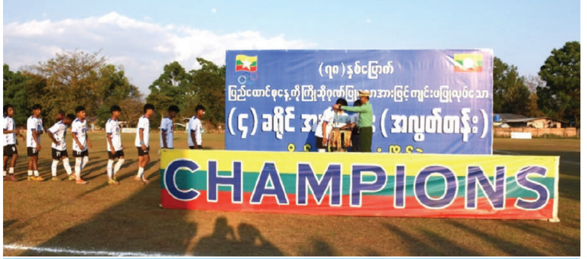
အရှေ့အလယ်ပိုင်းတိုင်းစစ်ဌာနချုပ် တိုင်းမှူး ဗိုလ်ချုပ်မှူးမင်းထွန်း တစ်ဦးချင်းဆုရရှိကြသူများကို ဆုတံဆိပ်များနှင့် ငွေသား ဆုများ ပေးအပ်ချီးမြှင့်စဉ်။

နေပြည်တော် ဖေဖော်ဝါရီ ၁၀ ၇၈ နှစ်မြောက် ပြည်ထောင်စုနေ့ကို ကြိုဆိုဂုဏ်ပြုသောအားဖြင့် ၂၀၂၅ ခုနှစ် လေးခရိုင် အမျိုးသားအလွတ်တန်းဖိတ်ခေါ် ဘောလုံးပြိုင်ပွဲ ပိတ်ပွဲနှင့် ဆုပေးပွဲကို ယနေ့ညနေပိုင်းတွင် ရှမ်းပြည်နယ် (တောင်ပိုင်း) နှစ်စန့်မြို့နယ် အသင်းက တစ်စု၊ ဝိုးမရှိဖြင့် အနိုင်ရရှိ ခဲ့သည်။ အလယ်ပိုင်းတိုင်းစစ်ဌာနချုပ် တိုင်းမှူး ဗိုလ်ချုပ်မှူးမင်းထွန်းနှင့် တာဝန်ရှိသူများ၊ ဌာနဆိုင်ရာ ဝန်ထမ်းများ၊ ကျောင်းသား၊ ကျောင်းသူများ၊ ပြိုင်ပွဲဝင်အသင်းများ၊ ဒိုင်အဖွဲ့ဝင်များ၊ အားကစားဝါသနာရှင်များ၊ ဒေသခံတိုင်းရင်းသားများ တက်ရောက် ကြသည်။