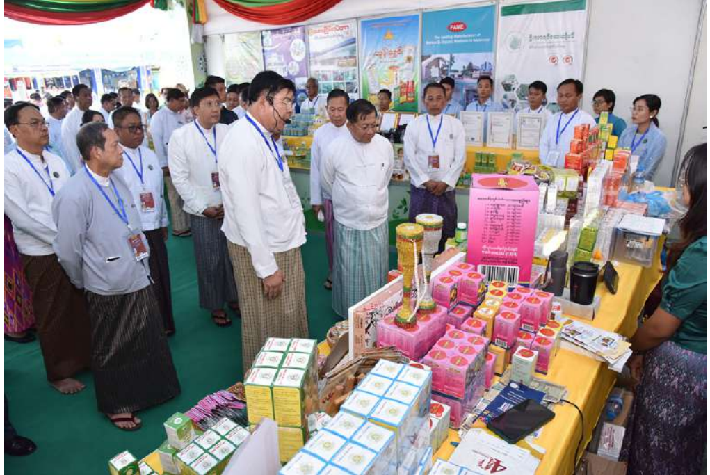
နိုင်ငံတော်စီမံအုပ်ချုပ်ရေးကောင်စီဥက္ကဋ္ဌ နိုင်ငံတော်ဝန်ကြီးချုပ် ဗိုလ်ချုပ်မှူးကြီးစိုးဝင်းအောင်လှိုင်နှင့်အဖွဲ့ဝင်များ ဝန်ကြီးဌာနပြခန်းများ၊ နေပြည်တော်ကောင်စီ၊ တိုင်းဒေသကြီးနှင့်ပြည်နယ်များ၊ အသင်းအဖွဲ့များ၏ ပြခန်းတစ်ခုချင်းစီအလိုက် စိတ်ပါဝင်စားစွာဖြင့် လိုက်လံကြည့်ရှုစဉ်။