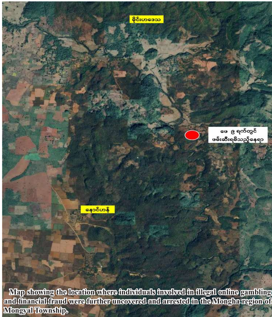
Map showing the location where individuals involved in illegal online gambling and financial fraud were further uncovered and arrested in the Mongha region of Mongyal Township.

The government is collaborating with neighboring countries and international organizations to rigorously investigate and decisively take action against those involved in illegal online gambling, financial fraud, and other criminal activities. 100