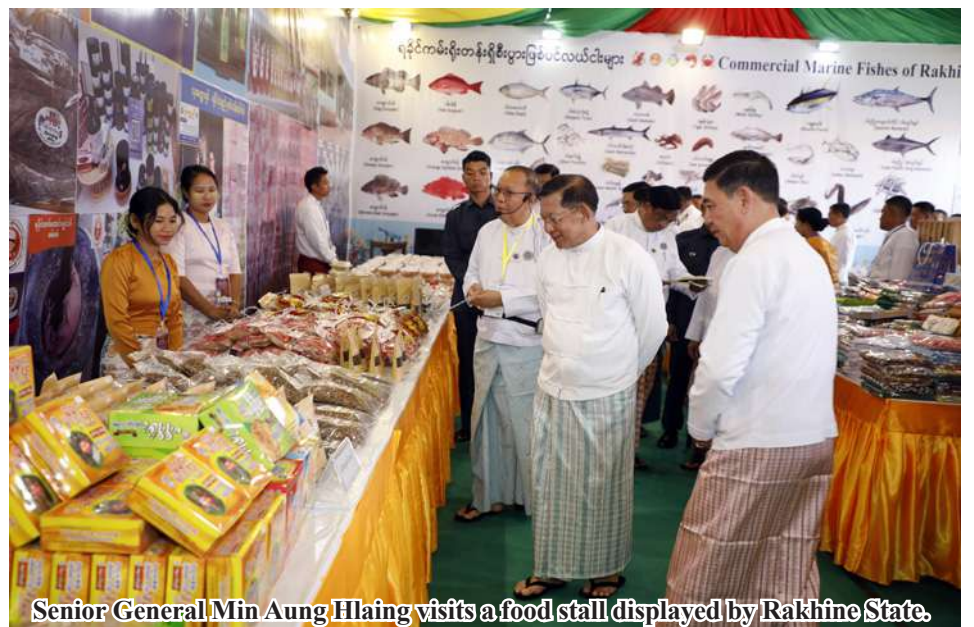
Senior General Min Aung Hlaing visits a food stall displayed by Rakhine State.