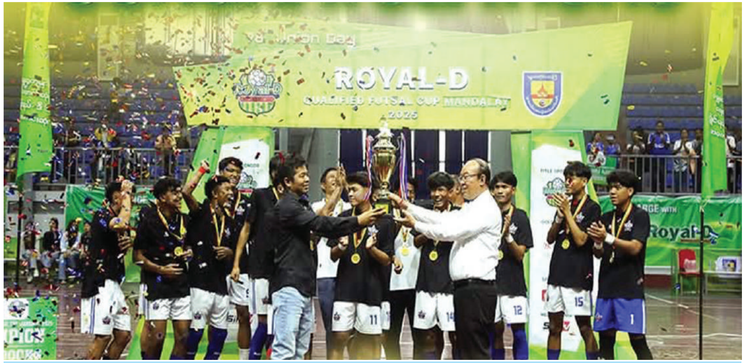
Royal-D Qualified Futsal Cup Mandalay 2025 ပြိုင်ပွဲတွင် ချန်ပီယံဆုဆွတ်ခူးနိုင်ခဲ့သည့် Mali Kyal Sin အသင်းကို တွေ့ရစဉ်။

မန္တလေး ဖေဖော်ဝါရီ ၁၀ မန္တလေးတိုင်းဒေသကြီး သဲသောင်ပြင်နှင့် ဖူဆယ် ကော်မတီက ကြီးမှူးကျင်းပသည့် Royal-D Qualified Futsal Cup Mandalay 2025 ပြိုင်ပွဲ တတိယနေရာ လုပွဲနှင့် ဗိုလ်လုပွဲစဉ်တို့ကို ယနေ့နံနက်ပိုင်းက မန္တလေးမြို့ မန္တလာသီရိအားကစားကွင်းရှိ Multipurpose Stadium တွင် ကျင်းပခဲ့ရာ SK FC အသင်းကို ခြောက်ဂိုး နှစ်ဂိုးဖြင့် အနိုင်ရရှိခဲ့ပြီး Mali Kyal Sin အသင်း ချန်ပီယံဆုဆွတ်ခူးနိုင်ခဲ့ကြောင်း သိရသည်။ 2025 ပြိုင်ပွဲ တတိယနေရာလုပွဲစဉ်အဖြစ် နံနက် ၈ နာရီက Phoenix အသင်းနှင့် ခိုင်မြဲသစ္စာအသင်းတို့ ယှဉ်ပြိုင်ကစားခဲ့ရာ Phoenix အသင်းက နှစ်ဂိုး ဂိုးမရှိဖြင့် အနိုင်ရရှိခဲ့ကာ တတိယဆုဆွတ်ခူးနိုင်ခဲ့ပြီး အဆိုပါပွဲစဉ်အတွက် စာမျက်နှာ ၂၁ ကော်လံ ၃ ☆