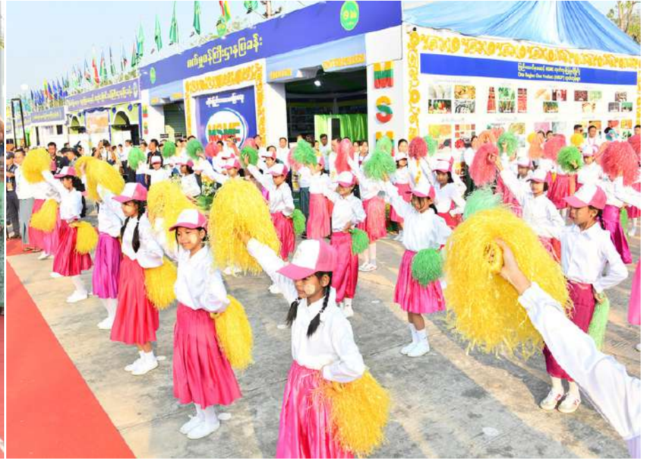
နိုင်ငံတော်စီမံအုပ်ချုပ်ရေးကောင်စီဥက္ကဋ္ဌ နိုင်ငံတော်ဝန်ကြီးချုပ် ဗိုလ်ချုပ်မှူးကြီးမင်းအောင်လှိုင်နှင့်အဖွဲ့ဝင်များ ၇၈ နှစ်မြောက် ပြည်ထောင်စုနေ့အထိမ်းအမှတ် MSME ထုတ်ကုန်ပြပွဲနှင့်ပြိုင်ပွဲ ဖွင့်ပွဲအခမ်းအနား ဂုဏ်ပြုတေးသီချင်းဖြင့် တိုင်းရင်းသားရိုးရာယဉ်ကျေးမှုအကအဖွဲ့များက ကပြဖျော်ဖြေတင်ဆက်နေမှုကို ကြည့်ရှုအားပေးစဉ်။