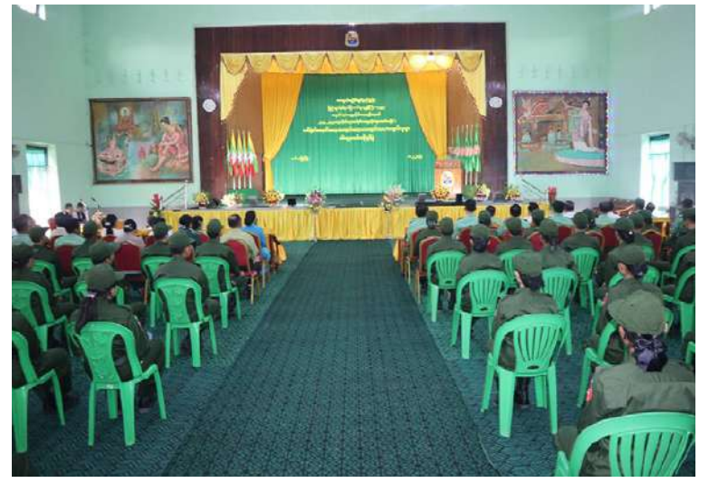
အရှေ့တောင်တိုင်းစစ်ဌာနချုပ်၌ တက္ကသိုလ်လေ့ကျင့်ရေးတပ်ဖွဲ့ဝင် ဆရာ၊ ဆရာမ များနှင့် ကျောင်းသား၊ ကျောင်းသူများကို အခြေခံစစ်ပညာသင်တန်းနှင့် တန်းမြှင့် စစ်ပညာသင်တန်းများ ဖွင့်ပွဲကျင်းပစဉ်။