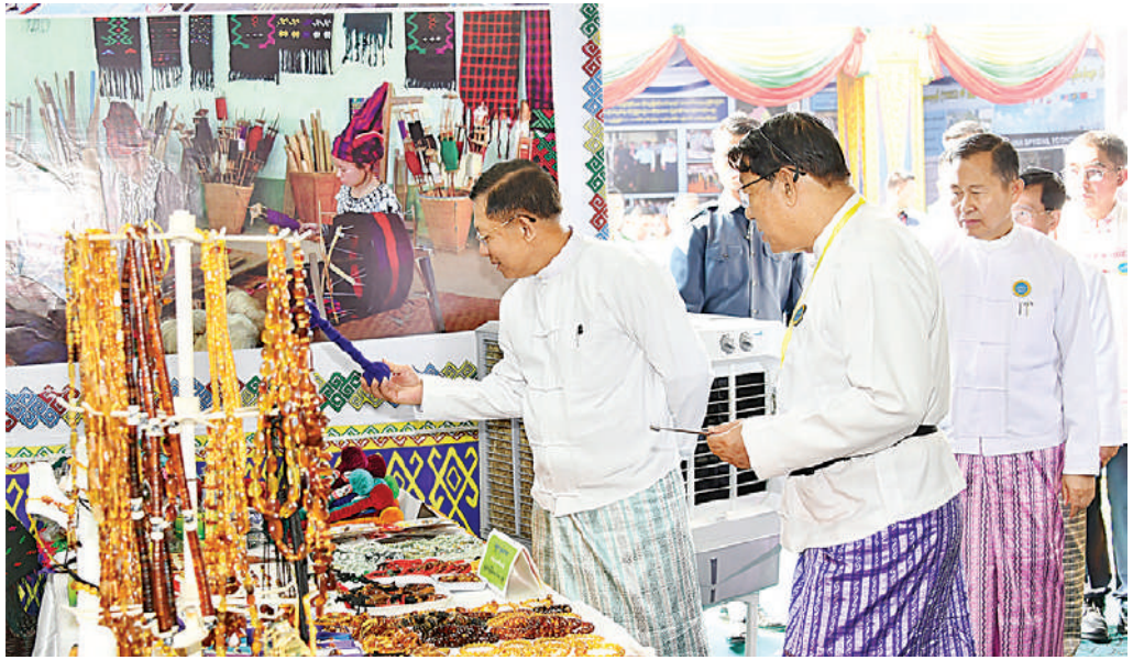
နိုင်ငံတော်စီမံအုပ်ချုပ်ရေးကောင်စီဥက္ကဋ္ဌ နိုင်ငံတော်ဝန်ကြီးချုပ် ဗိုလ်ချုပ်မှူးကြီးမင်းအောင်လှိုင်နှင့်အဖွဲ့ဝင်များ ဝန်ကြီးဌာနပြခန်းများ၊ နေပြည်တော်ကောင်စီ၊ တိုင်းဒေသကြီးနှင့် ပြည်နယ်များ၊ အသင်းအဖွဲ့များ၏ ပြခန်းတစ်ခုချင်းစီအလိုက် စိတ်ပါဝင်စားစွာဖြင့် လိုက်လံကြည့်ရှုစဉ်။

စာမျက်နှာ ၁၇ မှအဆက် အရောင်းပြခန်းတို့ကို ပြခန်းတစ်ခုချင်းစီ အလိုက် စိတ်ပါဝင်စားစွာဖြင့် လိုက်လံ ကြည့်ရှုအားပေးပြီး ထုတ်ကုန်များအလိုက် လုပ်ငန်းဆောင်ရွက်မှုများ၊ ကုန်ကြမ်းရရှိမှု နှင့်သုံးစွဲမှု၊ ထုတ်ကုန်များထုတ်လုပ်မှု၊ ပြည်တွင်းပြည်ပဈေးကွက်ရရှိမှုအခြေအနေ များလုပ်ငန်းလိုအပ်ချက်များနှင့် ပြည်တွင်း၊ ပြည်ပသို့ ပိုမိုတိုးချဲ့ဖြန့်ဖြူးနိုင်မည့်အခြေ အနေများနှင့် သိရှိလိုသည်များ မေးမြန်း ဆွေးနွေးပြီး လိုအပ်သည်များလမ်းညွှန်မှာ ကြာပြည့်ဆည်းဆောင်ရွက်ပေးသည်။